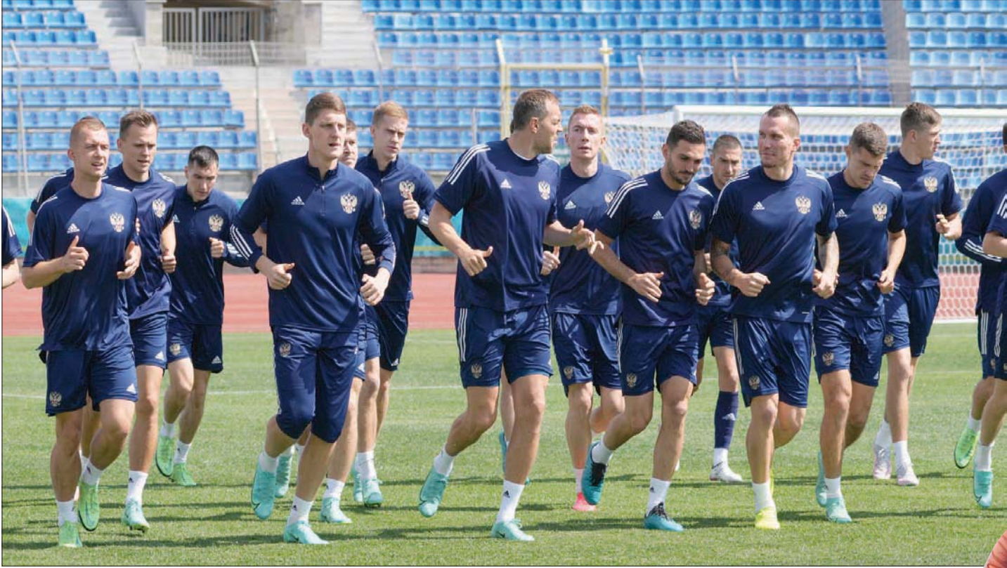
المنتخب الروسي يستعد لاختبار صعب أمام بلجيكا

كومان، خاضت ويلز أول بطولة كبرى منذ 58 عاماً، وبلغت قبل النهائي قبل الخسارة من البرتغال التي توجت باللقب فيما بعد. وتبقى خمسة لاعبين فقط من البطولة التي أثبتت خلالها ويلز أنها قادرة على المنافسة ضد المنتخبات الكبرى، وكولمان لم يعد موجوداً، وحل محله جناح مانستسر يونايكس السابق راين غيغز. وسيجول روبرت بيدج مساعد غيغز المسؤولة خلال البطولة في غياب غيغز الذي يواجه اتهامات بالاعتداء على سيدتين ويدفع ببراءة. ولا يزال الكثير متوقفاً من نجم 2016 غاريت بيل رغم خيبة أمله المتكررة مع الأندية سواء ريال