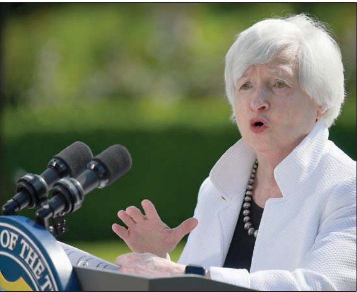
وزيرة الخزانة الأميركية تؤكد أن هناك أكثر من 2,7 مليار دولار من تعهدات المساعدات التي لم تلتزم بها بلادها

قدره 8,8 مليار دولار، بما يعادل 7,7 في المائة من إجمالي الناتج المحلي، حيث تعتزم تمويل هذا العجز من خلال الإقراض الخارجي والمقفل، في الوقت نفسه، تراهن دول شرق أفريقيا على التعافي الاقتصادي القوي لتحسين إيراداتها بما يسمح بتقليل عجز ميزانياتها. ويتوقع صندوق النقد الدولي نمو اقتصاد كينيا بمعدل 5,7 في المائة أوغندا بمعدل 5 في المائة، وتنزانيا بمعدل 4,6 في المائة، وإثيوبيا 8,7 في المائة من إجمالي الناتج المحلي. وتتوقع تنزانيا تراجع عجز الميزانية من 2,6 في المائة خلال العام الحالي، وفقاً للتوقعات، إلى 1,8 في المائة خلال العام المقبل، بحسب مشروع الميزانية الذي عرضه وزير المالية والتخطيط ميكلو نثينجيا على البرلمان في العاصمة دودوما.