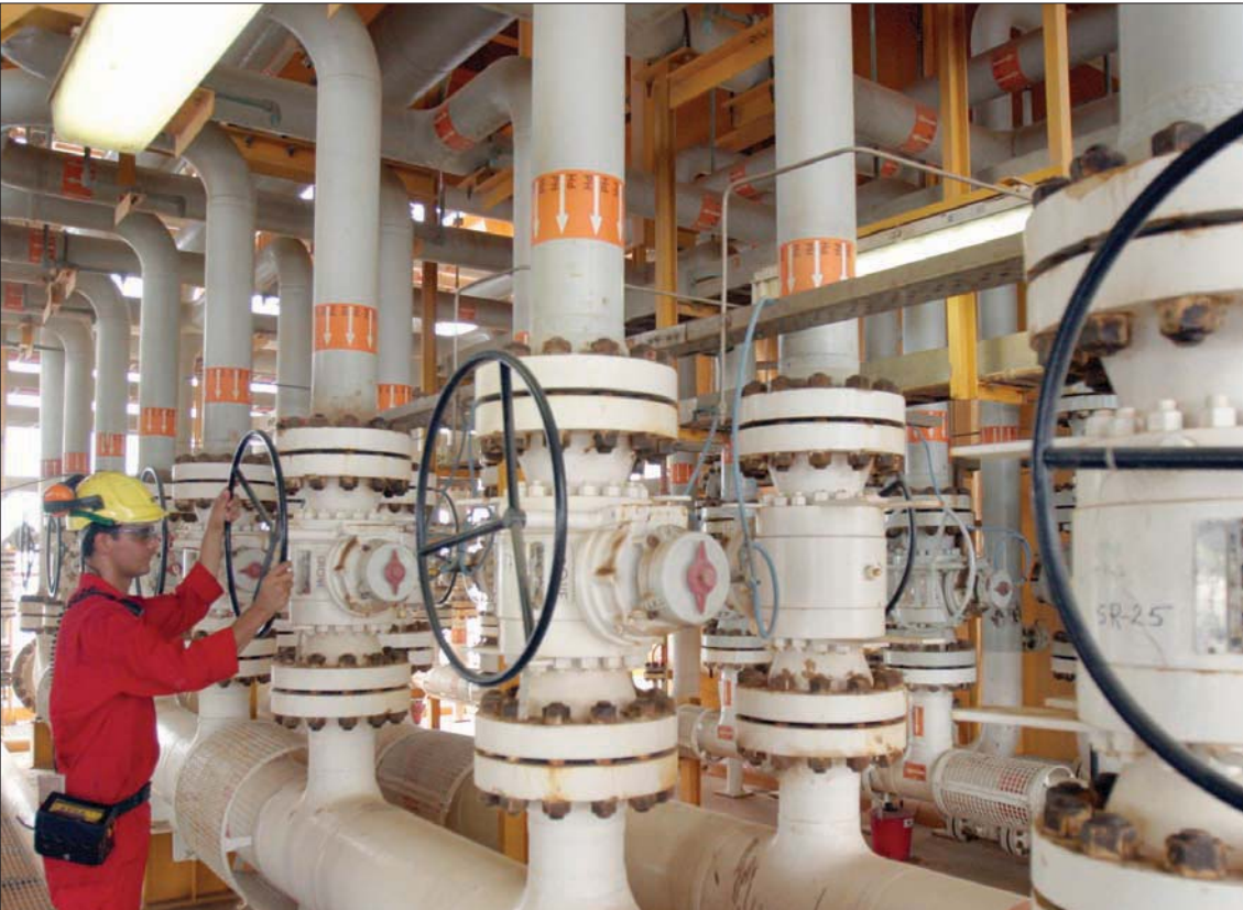
أحد مواقع إنتاج الطاقة في جنوب العاصمة الإيرانية طهران

في الوقت الذي أعلنت فيه الإدارة الأميركية عن رفع العقوبات عن ثلاثة مسؤولين إيرانيين سابقين، وبعض شركات الطاقة وسط تعثر المفاوضات النووية في فيينا، عبرت إدارة الرئيس بايدن عن استعدادها لرفع المزيد من العقوبات عن طهران، وذلك لتخفيف الضغط الاقتصادي عليها إذا غيرت البلاد مسارها. وتأتي هذه الإجراءات، في الوقت الذي يستعد فيه المفاوضون الأميركيون والإيرانيون والأوروبيون والصينيون في فيينا لبدء جولة سادسة من المحادثات، لاستعادة الاتفاق النووي لعام 2015 مع إيران والولايات المتحدة وخمس قوى عالمية أخرى، ومن المتوقع أن تبدأ المناقشات مرة أخرى في نهاية هذا الأسبوع في فيينا، بحسب ما أكد المتحدث الرسمي لوزارة الخارجية الأميركية نيد برايس.