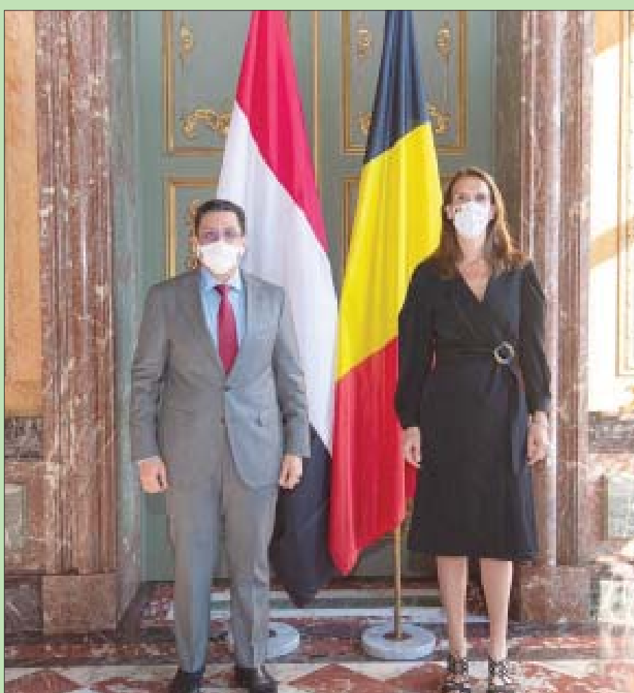
وزير الخارجية اليمني لدى لقائه وزيرة الخارجية البلجيكية في بروكسل

من جهته، أظهر زعيم الميليشيات عبد الملك الحوثي في أحدث خطبه عدم إكترائه الدولي بافتعال وخلق أزمة للمشتقات النفطية في المناطق الخاضعة لسيطرتها وإدعاء أن هناك حصاراً على دخول الوقود والمشتقات النفطية؛ وهي الإدعاءات التي تفندها بوضوح الإحصائيات في عدد من التقارير الدولية والتي تؤكد أن كميات الوقود في المناطق الخاضعة لسيطرة الميليشيات لم تنقطع، وأنها تغطي الاستخدام المدني والإستاني. وأضاف أن «الأزمة الإنسانية الحقيقية التي تحاول