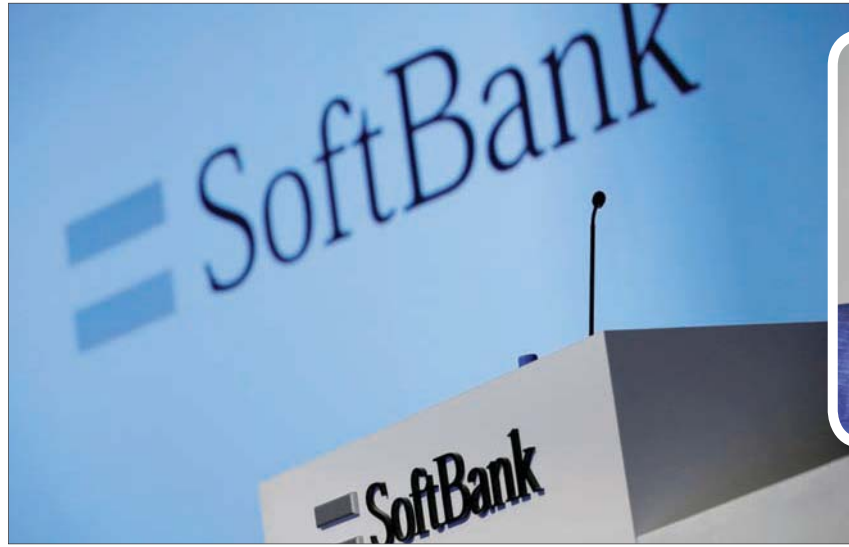
حققت «سوفت بنك» اليابانية أعلى إيرادات سنوية في تاريخها العام الماضي مدعومة بصندوقها رؤية 1 و2

شركات ناشئة تنشط في قطاع تكنولوجيا الخدمات البنكية، كان آخرها شركة Zeta التي حصلت على تمويل استثماري بقيمة 250 مليون دولار. وقال الريمج في هذا الشأن: «نحن نؤمن بإضفاء الطابع الديمقراطي على التمويل من خلال الابتكارات في مجال التكنولوجيا. نعتقد أن تجربة المستخدم وخفض التكاليف والاحتكاك، وسهولة الوصول، كلها عوامل مستشكّل مستقبل قطاعات التأمين والإقراض والسمسرة». وتابع: «تواصل التكنولوجيا المالية (Fintech) تغيير جميع قطاعات الخدمات المالية، من الإقراض (Creditas) و (OakNorth)، إلى المدفوعات (VN Life)، إلى التأمين (ZhongAn) و (Policybazaar)، إلى الاستثمار (eToro)، ونحن نستثمر عبر جل هذه المجموعات». إلى جانب تكنولوجيا الخدمات البنكية، يرى الريمج فرصاً كبيرة لتضمين التكنولوجيا المالية في منصات الأعمال. ويوضح: «تمتلك Coupang و Rappi و Grab على