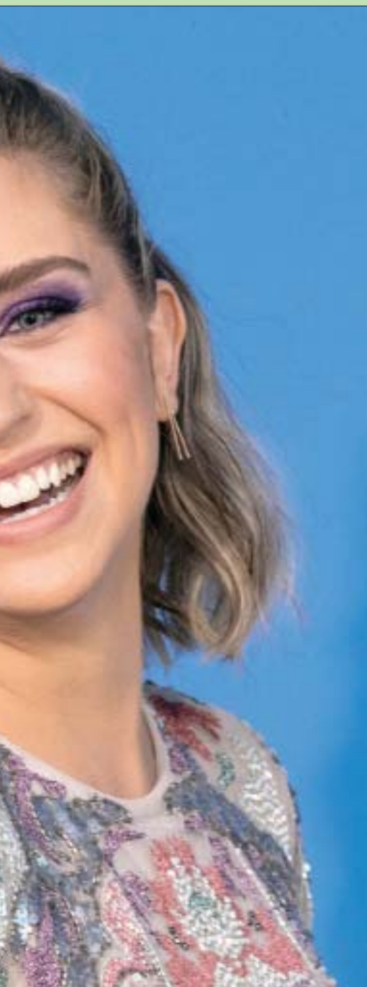
الممثلة الأميركية تايلور ميسيك تقف أمام المصورين قبل العرض الأول للموسم الثاني من البرنامج التلفزيوني «ديف» في لوس أنجلوس

5 لاعبين شباب يستحقون المتابعة في «يورو 2020»