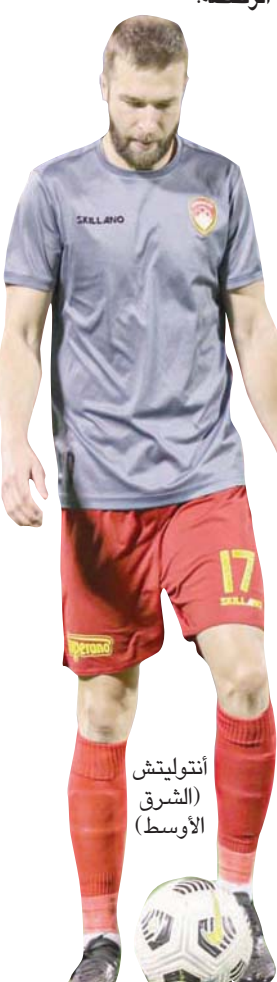
انتوليتش (الشرق الأوسط)