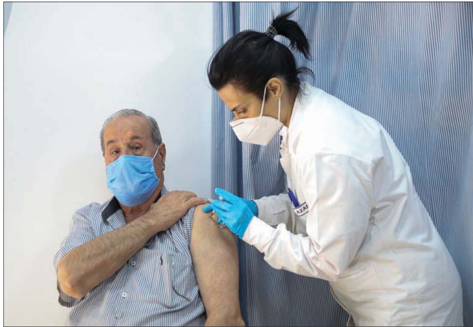
أحد مراكز التطعيم ضد «كورونا» في بيروت