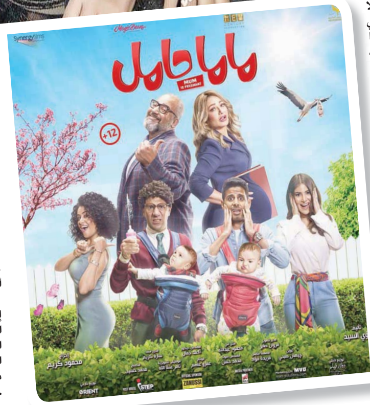
ملصق فيلم «ماما حامل»

ودرامياً، أشارت ليلي إلى أن عودتها للمسلسلات التلفزيونية عبر حدوتة (ست الهوانم) ضمن مسلسل «زي القمر» الذي تم عرضه قبيل موسم شهر رمضان الماضي، جاءت بعد تواصل المنتجة معها سليم معها، وإعجابها بمشروع المسلسل، فهو عمل فني تميز