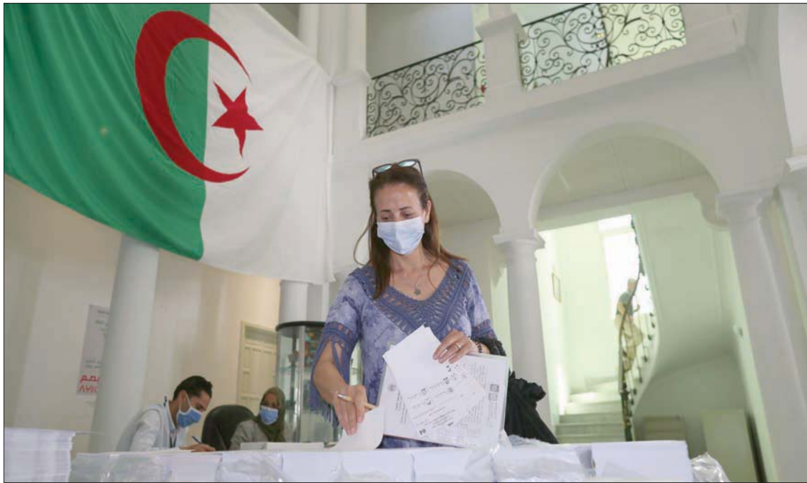
مهاجرة جزائرية تدلي بصوتها داخل قنصلية الجزائر في تونس بعد إعلان بدء الانتخابات للمهاجرين أول من أمس