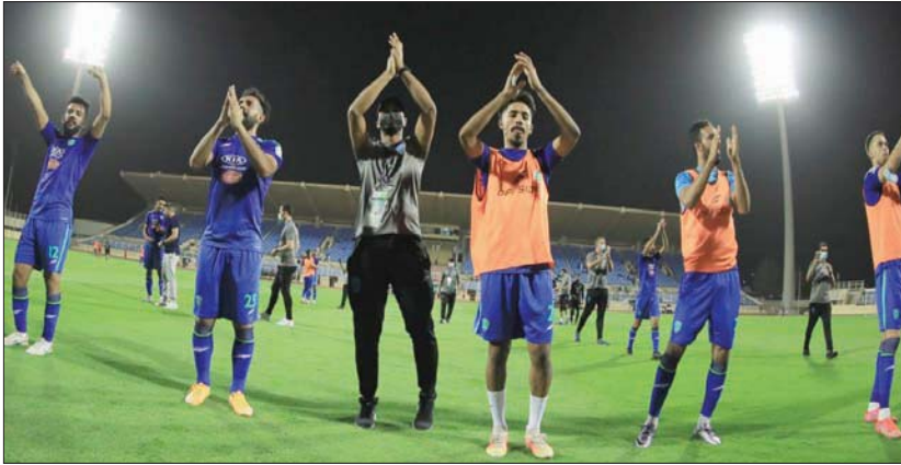
الاستقرار المالي والإداري في الفتح انعكس إيجاباً على أداء الفريق هذا الموسم

ويختتم في منتصف 2022» حيث إن السعة الجماهيرية الحالية (3500) لترتفع إلى الضعفين تقريبا حيث سيتم تجديد أرضيات الملعب وتصميم مضلات المدرجات والكراسي وإنشاء ملاعب بدون مضمار وتغيير كفاءة أبراج الإنارة وأنظمة الصوت والإنذار وإنشاء غرف وصالات لكبار الشخصيات ومناطق لخدمة الجمهور. وعبر رئيس النادي عن شكره الجزيل للقيادة السعودية على هذا الاهتمام والدعم غير المستغرب كما شكر وزير الرياضة على كل ما يقدمه في سبيل خدمة الأندية والرياضة وتيسير سبل النجاح.