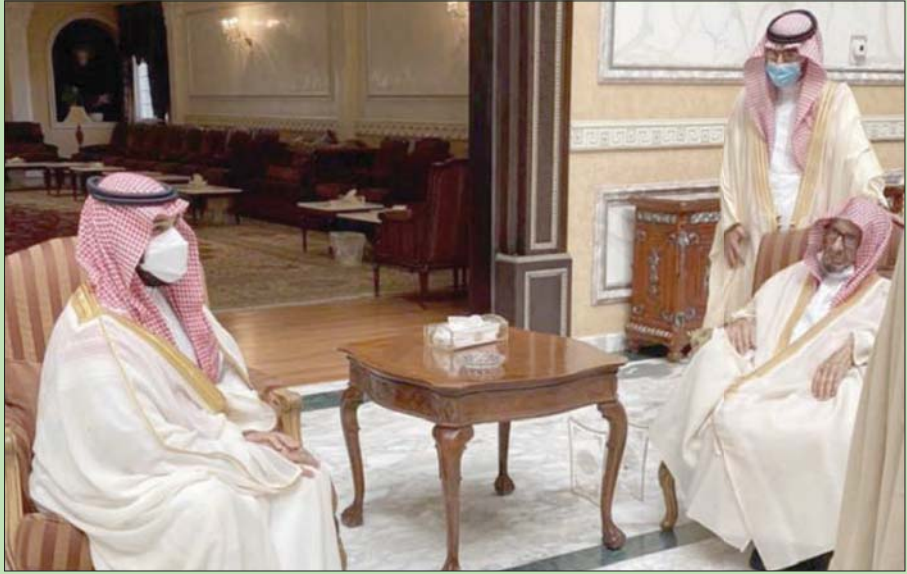
الأمير محمد بن سلمان ولي العهد خلال زيارته للشيخ ناصر الشثري بمناسبة عيد الفطر المبارك