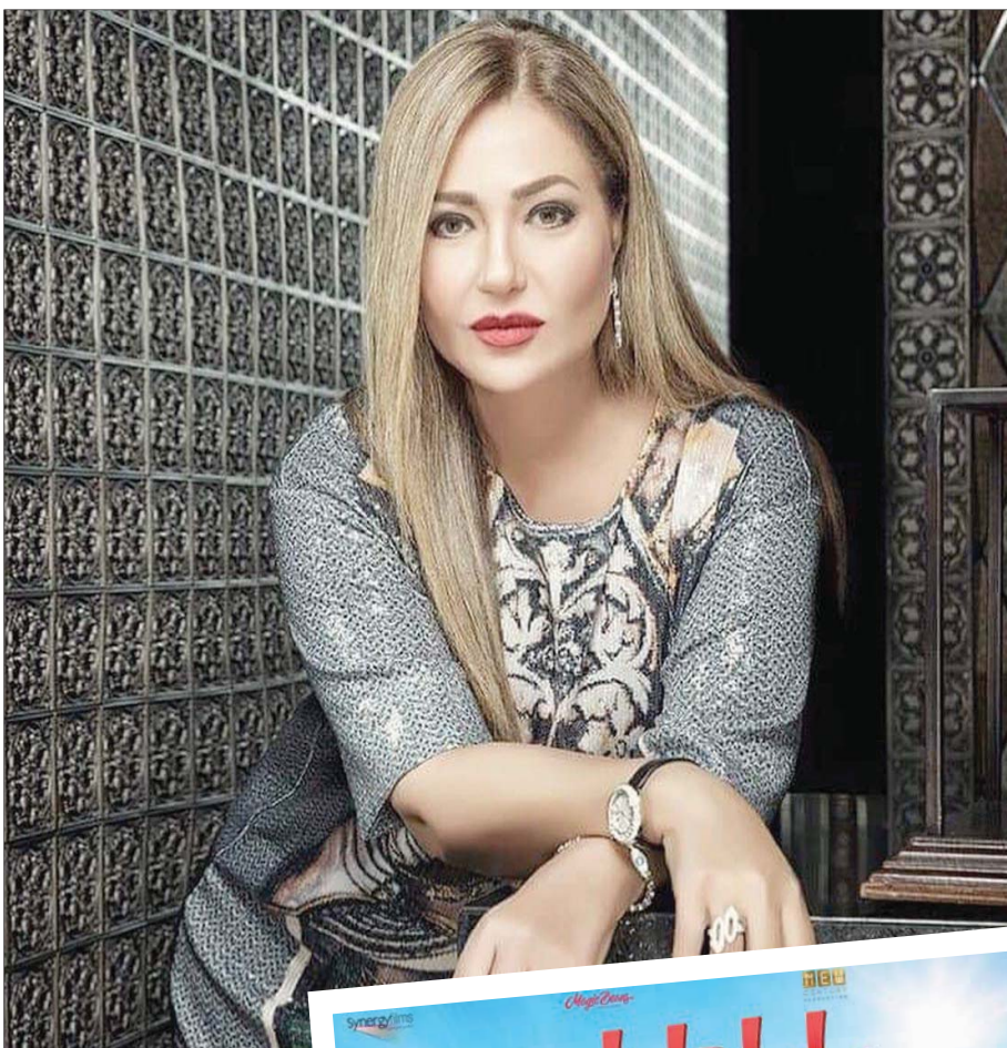
الفنانة المصرية ليلي علوي

وعن عودتها للسينما بفيديو كوميدي تقول: «الناس تبحث دائماً عن الضحك، والفيلم مختلف بشكل كبير عما قدمته من قبل، فانا استمتعت بكواليس تصويره جداً، لذلك أثق في إيجاب الجمهور به، وخصوصاً الذين يتشوقون لهذا النوع تحديداً وبسط أجواء (كورونا)، كما أن الأعمال الكوميديّة لها جمهور عريض من مختلف