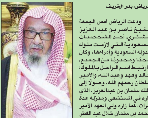
الشيخ ناصر الشثري

ويحمل الإعلامي السعودي الزميل عبد الله ناصر الشهري ممثل وكالة الأوساط مقراً لإقامة الشثري، عاشها بنفسه حيث أبلغ «الشرق الأوسط» أمس أن الراحل كان محل ثقة القيادة السعودية خلال عدة عقود كما أنه وسبق اقتلهم حافلة، وخلال الرحلة تحدث القذافي عن موضوعات سياسية واقتصادية وغيرها، بعضها أزعج الوفد السعودي، فأنبهر له الوفد، ومنهم الشيخ الشثري فصاحته وسعة اطلاعه في العلوم الشرعية والتاريخية، وقدم حجاً وأسانيد تبين التجاوزات التي طرحها القذافي باعتبارها خارجة عن الخائب والمألوف، وبعدها عن الواقعة. ولأن الشيء بالشيء يذكر، فقد تم تداول قصة حدثت للشيخ الشثري مع القذافي خلال الزيارة، والذي دعاه الأخير للبقاء في ليبيا أياماً بعد مغادرة الوفد السعودي، لاصطحابه في جولات مماثلة على معالم ليبيا وكان الملك خالد وأعضاء الوفد يستمعون باصداق قرات في قضية معروضة أمام مجلس القضاء الأعلى، من شأنه إنهاء نزاع بين قريتين فلم يتردد الراحل في إقبال هذا الطلب، وكان تدخله سبباً في إنهاء ذلك النزاع.