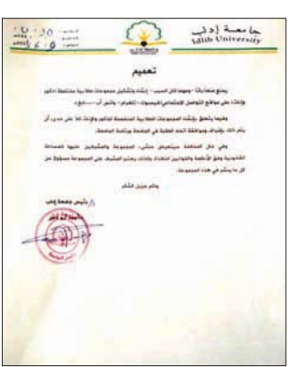
نص قرار جامعة إدلب

الأسباب كافة، لكن يتم التخفيف من هذه الظواهر اعتقاداً أن هناك تغييرات سياسية قادمة.