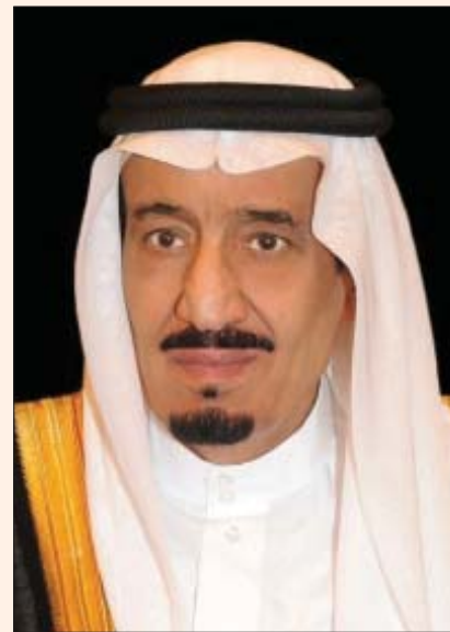
نيوم، «الشرق الأوسط»

وأجرى الأمير محمد بن سلمان بن عبد العزيز ولي العهد نائب رئيس مجلس الوزراء وزير الدفاع السعودي اتصالاً هاتفياً أمس بالشيخ نواف الأحمد الصباح أمير الكويت.