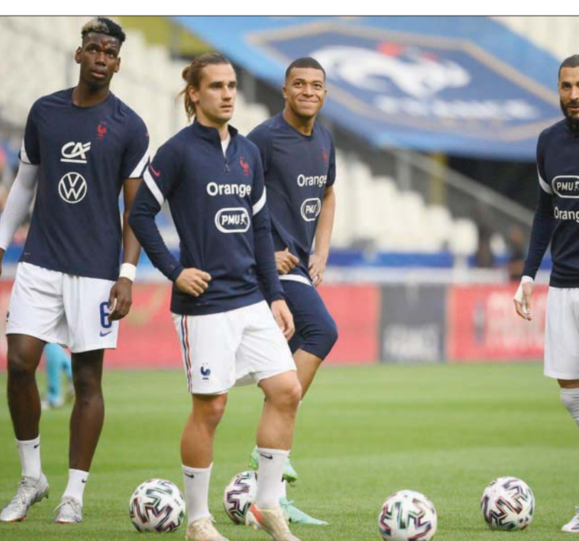
المنتخب الفرنسي مرشح بقوة لنيل اللقب في وجود بنزيمة ومبابي وغريزمان ويوغيا

اللقب أقوى من الوقت الذي توج فيه الفريق بلقب البطولة في 2016 بعد التغلب على المنتخب الفرنسي في باريس. وتمت إضافة روين دياز ولاعب خط الوسط برونو فرنانديز وجواو فيليكس للفريق الذي ما زال يقوده كريستيانو رونالدو. ولكنهم حكماء بدخول البطولة بحذر، خاصة أن المنتخب البرتغالي يوجد في مجموعة صعبة، حيث تنتظره مباراة أخرى مع المنتخب