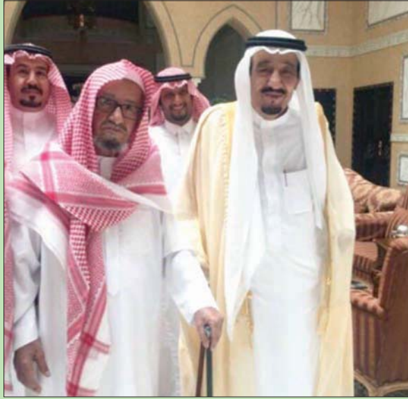
الملك سلمان في زيارة سابقة للشيخ ناصر الشثري في منزله

ليبيا سوف يواجه المصير نفسه الذي واجهه الإمام الشيعي موسى الصدر، قائلاً: «إذا قعدت في ليبيا فسوف يغيب شمسك مثل ما غيب شمس موسى الصدر»، في إشارة إلى الشوك والانهزام التي تم افتتاحها بهذا الشأن حول اختفاء الصدر وما زال ملف الاختفاء مفتوحاً إلى اليوم رغم مرور أكثر من أربعة عقود على هذا الحادث، وعندما انتهى الملك خالد من كلامه تعالت الصيحات.