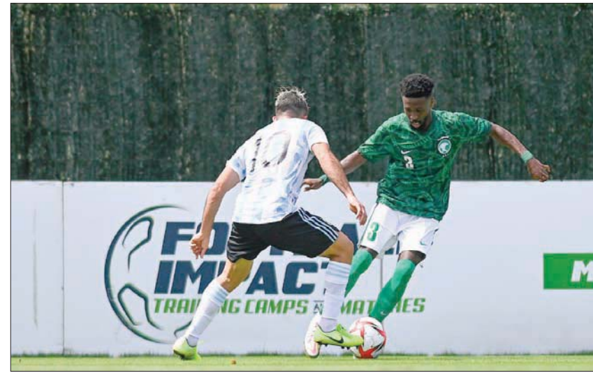
جانب من المواجهة التي جمعت الأخضر الأولمبي ونظيره الأرجنتيني (الشرق الأوسط)

الثانية في العام 1996 باتالانتا، حيث يسعى المدرب إلى تسجيل حضور قوي والعبور إلى الدوري الثاني كإنجاز كامله مدرب المنتخب الأولمبي لاختيار ما يراه من اللاعبين مقيداً للمشاركة الأولمبية التي ستسبق التصفيات النهائية المؤهلة للمونديال المقررة في سبتمبر (أيلول) المقبل كما حدد لها في وقت سابق.