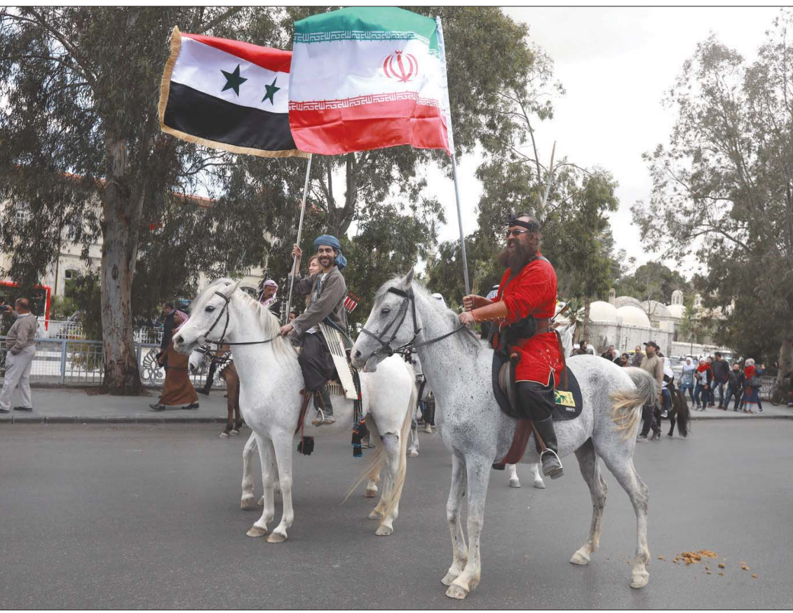
رجلان على حصانين أحدهما يحمل العلم الإيراني والآخر السوري بدمشق في أبريل من العام الماضي

مخصصات منج من المحرقات. كما سُجل إضراب عام تشهده مدينة منج الخاضعة لسيطرة قوات مجلس منج العسكري بريف حلب الشمالي الشرقي، وذلك احتجاجاً على قرار التجنيد الإلزامي، ضمن مناطق الإدارة الذاتية والحملة القائمة الآن، التي جرى خلالها اعتقال وتوقيف المئات من أجل التجنيد في جميع المناطق. وكان «المركز» أشار، في 28 مايو (أيار)، إلى أن الشرطة العسكرية التابعة لقوات سوريا الديمقراطية، تواصل حملة التجنيد الإلزامي في صفوفها، تحت مسمى «واجب الدفاع الذاتي»، حيث تستهدف الحملة مواليد 1990 وحتى 2003. وتلاحق الشرطة العسكرية الشبان في منازلهم وتعتقل من لديه قيود وسجلات مدنية صادرة عن مؤسسات «قدس». ورصد نشطاء انتشار الدوريات في عموم مناطق «الإدارة الذاتية»، حيث اعتقلت، خلال الأيام الفائتة، مئات الشبان في كل من الرقة والحسكة ودير الزور، إضافة إلى منج في حلب شرقاً.