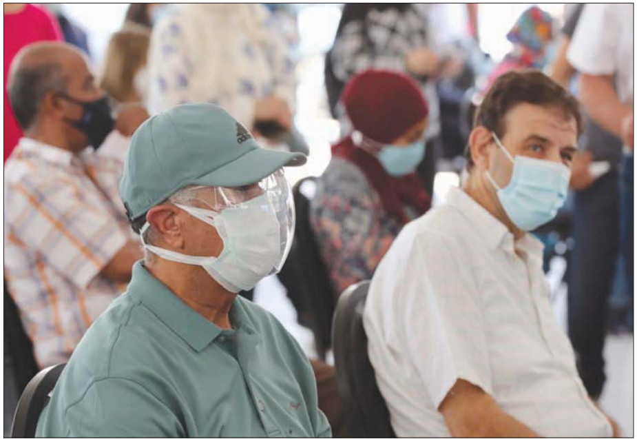
مركز تطعيم ضد «كوفيد - 19» في القاهرة

تطبيق الغرامة على المخالفات الخاصة بتلك الإجراءات». وخلال اجتماع اللجنة، أول من أمس، أكد رئيس الوزراء، مصطفى مدبولي، «استمرار الدولة في اتخاذ جميع الإجراءات والقرارات، التي من شأنها الحفاظ على سلامة وصحة جميع المواطنين، كما أن الحكومة تعمل على قدم وساق؛ من أجل وضع جميع المنشآت الطبية والمستشفيات العزاء والأفراح، والالتزام بإقامة الأفراح في الأماكن المفتوحة فقط». وقالت وزيرة الصحة، هالة