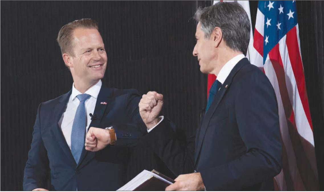
وزير الخارجية الأميركي أنتوني بلينكن مع نظيره الدنماركي خلال زيارته الأخيرة لكوبنهاغن

«عملية دنهام»، وقد تم في 2015. ووفقاً للتحقيق الذي يشمل الفترة من 2012 حتى 2014، استخدمت الوكالة الأميركية كابات دنماركية خاصة بالمعلومات للتجسس على مسؤولين كبار بهذه الدول منهم الرئيس الألماني فرانك فالتر شتاينماير، الذي كان وزيراً للخارجية آنذاك، وزعيم المعارضة السابق في ألمانيا بيير شتاينبروك.