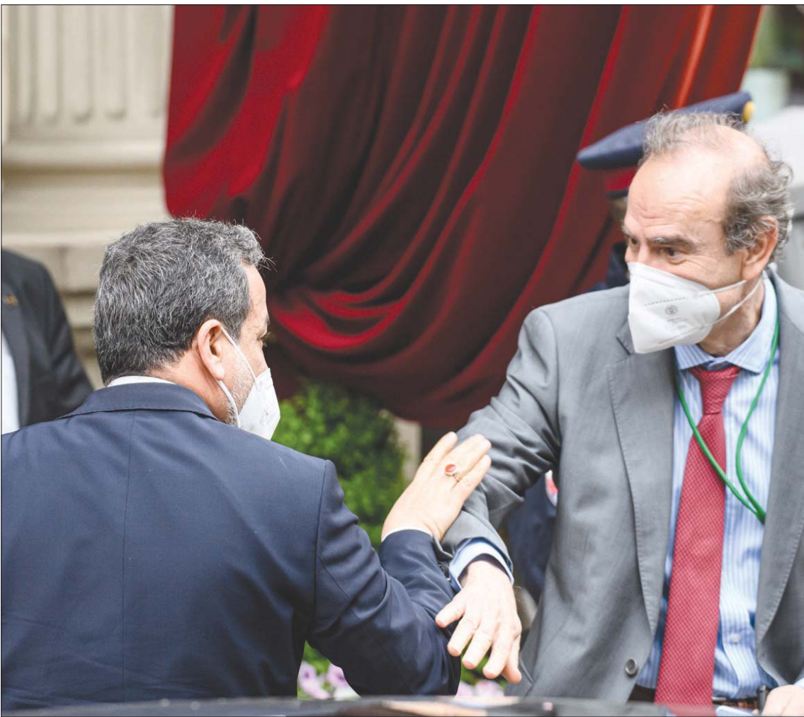
المدير السياسي للاتحاد الأوروبي إنريكي مورا يصافح كبير المفاوضين الإيرانيين عباس عراققي عند وصولهما إلى فيينا الأسبوع الماضي (إبأ)

في كتابته، كتب النائب السابق علي مطهري، وأحد المستبعدين من سباق الانتخابات، من تغريدة عبر إنستغرام، أن «الخط الأحمر للنظام هو إشارة الفوضى والتخريب أو القيام بعمل مسلح، أي من المرشحين ينوي ذلك، إذا كان المقصود من الخط