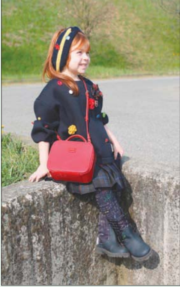
من «دولتشي أند غابانا»