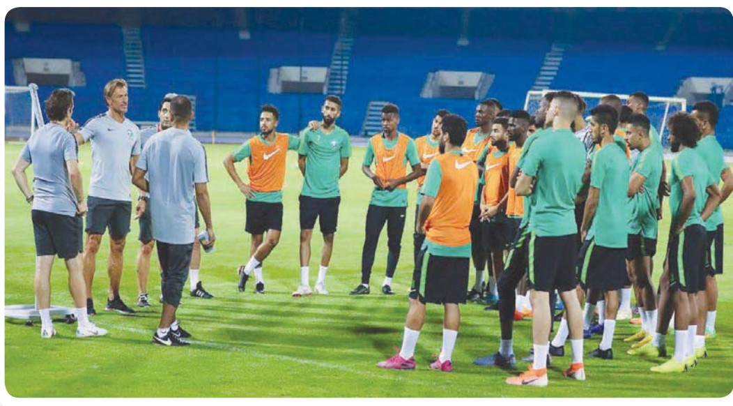
رينارد مع لاعبي الأخضر في إطار التحضيرات لتصفيات المونديال (الشرق الأوسط)

وأكد الاتحاد السوري هذا الخبر بعد إعلانه على موقعه الرسمي أن الاتحاد الآسيوي لكرة القدم يعتمد دولة الإمارات العربية المتحدة مكاناً لاستكمال مباريات المجموعة الآسيوية الأولى عوضاً عن الصين وسيتم تحديد جدولة مواعيد المباريات وأوقات إقامتها لاحقاً.