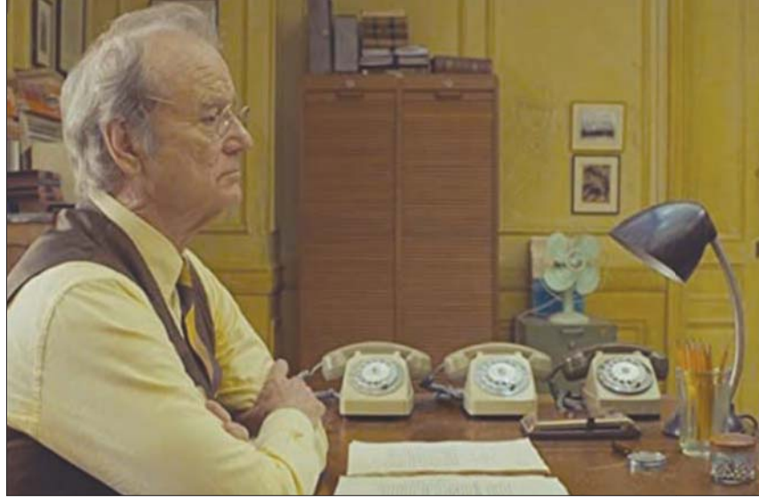
بل موراي في «ذا فرنش إكزيت»

يختلف هذا الفيلم عن أعمال أندرسن السابقة (خصوصاً عن «الحياة البحرية مع ستيف زيسو»، 2004 و«ذا رويال تيننوم»، 2001) في كونه يتناول حكاية ذات أزمنة متعددة مروية عبر ثلاثة رواة كل منهم داخل الآخر (على طريقة