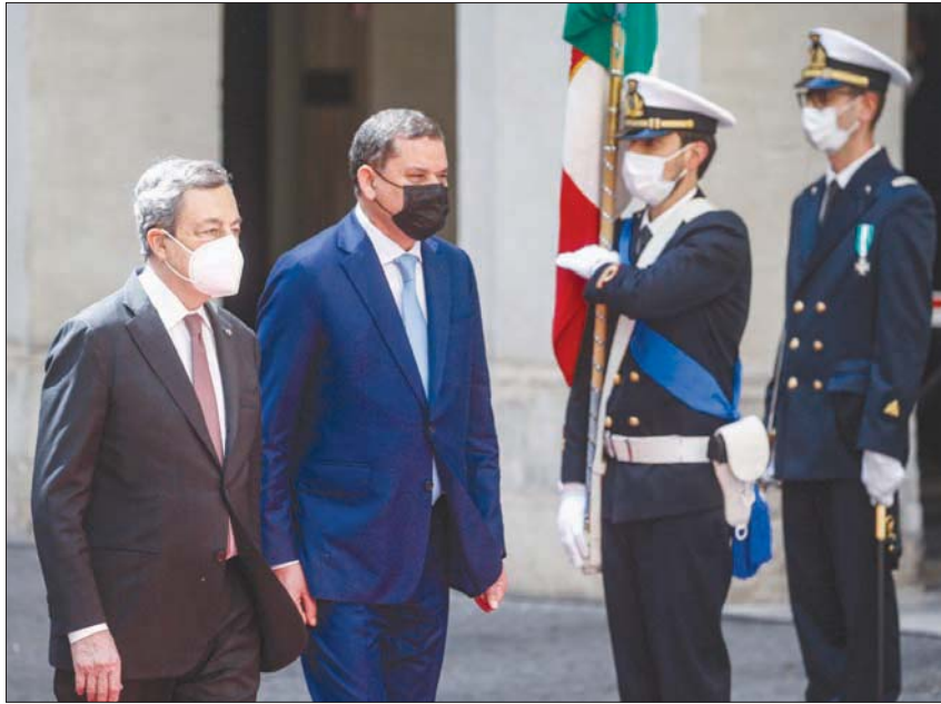
رئيس الحكومة الإيطالية مستقبلاً الدببية أمس في القصر الرئاسي بروما

لإنجاز هذا الاستحقاق الهام في هذه المرحلة»، مشيراً إلى أن لجنة تسلم وفرز وقبول ملفات المرشحين، المشكلة بموجب قرار صالح، أنهت أعمالها نهاية أبريل (نيسان) الماضي، وأن رئاسة