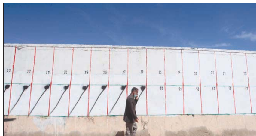
جانب من الحملة الانتخابية للمرشحين في عين وسارة بولاية الجلفة جنوب الجزائر العاصمة

حزبا جبهة التحرير والتجمع الديمقراطي عماد السلطة خلال حكم بوتفليقة، الذي استمر منذ عام 1997 أجرت الجزائر أول انتخابات برلمانية منذ الانتخابات الملقاة عام 1992، وكان الفوز بفارق كبير (156 نائبا) لحزب التجمع الوطني الديمقراطي، وهو حزب جديد أسسته السلطات، التي كانت أطراف فيها تخشى عدم ولاء قيادة جبهة التحرير الوطني لها. وحلّت حركة مجتمع السلم (69 نائبا) الذي بات الحزب الإسلامي الأساسي في البلاد بعد حظر حزب جبهة الإنقاذ. في انتخابات 2002، عادت جبهة التحرير لتصدر الساحة بفوزها بـ199 مقعدا برلمانياً، في مقابل تراجع التجمع الديمقراطي إلى المرتبة الثالثة بـ47 مقعداً فقط (بعدما كان لديه 156 نائبا في انتخابات 1997). ويمكن أن يعزى هذا التراجع في أداء الحزب الأخرى إلى حقيقة أنه كان محسوباً على الرئيس اليمين زروال، وبعد تنحيه وانتقال السلطة إلى الرئيس بوتفليقة عاد رهان السلطة على الحزب التاريخي، جبهة التحرير التي تولّى بوتفليقة رئاستها شقيقاً. وفي انتخابات 2007، استمر حزب جبهة التحرير في تصدر المشهد بـ136 مقعداً، يليه التجمع الديمقراطي بـ61 مقعداً. وفي انتخابات 2012 لم تتغير الصورة: جبهة التحرير متصدرة بـ208 مقاعد، متبوعة بـ58 مقعداً. وفي انتخابات 2017 تكرر المشهد بـ146 مقعداً، يليها التجمع الديمقراطي بـ97 مقعداً. وكما هو واضح، شكّل