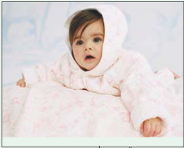
من «دولتشي أند غابانا»

كل ما سبق، على تنوع ملاحظاتها، ينضوي تحت الهوية المحددة لما هو «فيلم من إخراج وس أندرسن». التفاوت بين فيلم وآخر ليس بالأسلوب ولا بالتصاميم والعناصر البصرية؛ لأنها ممارسة دوماً، بل هي بالقر الذي تستطيع الحكاية فيه إشباع فضول المشاهد. وهي تفعل ذلك حبال العديد ممن يحثون عن الفيلم غير السائد وعن الأعمال التي من الممكن وصفها بالفنية من دون حرج.