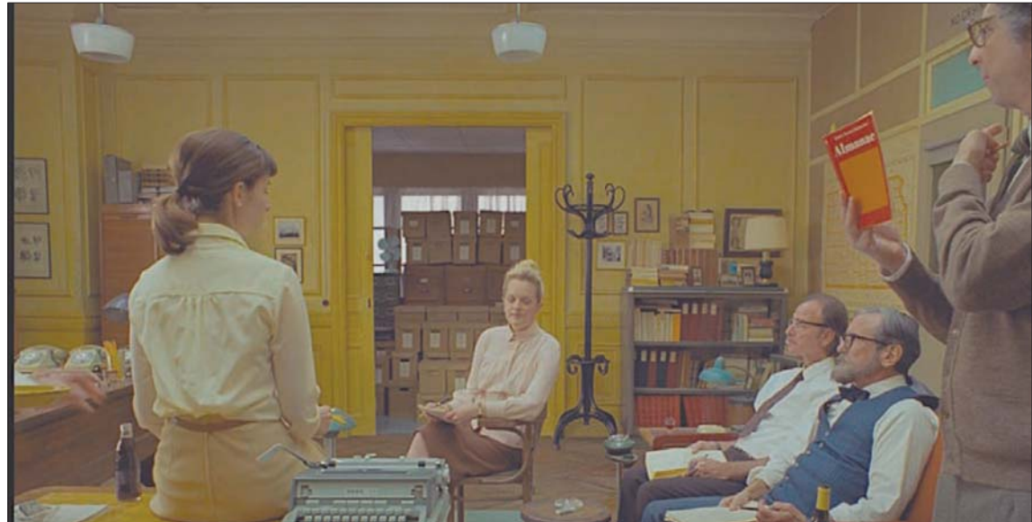
لقطة من «ذا فرنش إكزيت»