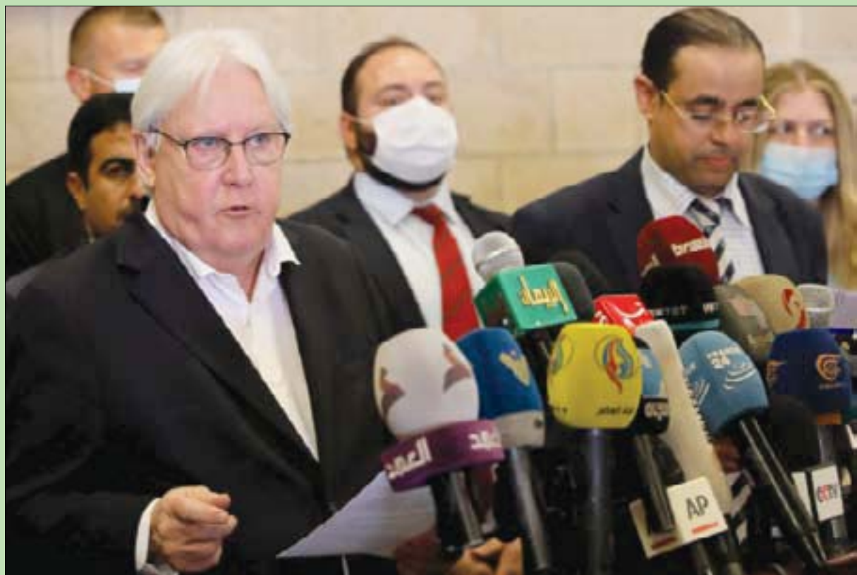
غريفيث يتحدث أمام الصحفيين في مطار صنعاء أمس

وحبس ما يرحبه مراقبون للحالة اليمنية، فإن موافقة الميليشيات الحوثية أخيراً على لقاء غريفيث والسماح له بزيارة صنعاء، يأتي في سياق مراوغاتها المستمرة للتهرب من أي اتفاق، وبخاصة وقد تأكد لها أن غريفيث يقضي أيامه الأخيرة في الملف اليمني، ولا تريد له أن يخارده بشهادة أخيرة صنعها بالتهرب من مساعي السلام. وفي تقدير المراقبين، كانت الميليشيات المدعومة من إيران تطمح ولا تزال لتحقيق إنجاز عسكري بالسيطرة على محافظة مأرب النفطية حيث أهم معابر شرعية للدخول في أي مشاورات، بل أوراق قوة جديدة على الأرض، وهو الأمر الذي فشلت في إنجازه، كما أنه الأمر ذاته الذي يمنعه حتى الآن من قبول خطة المبعوث الأممي، التي تحوي ضمناً في خطوطها العريضة على ما احتوته المبادرة السعودية الأخيرة. يشير إلى قادة الجماعة كانوا صرحوا علناً بأنه لا طائل من وجود مبعوث أممي إلى اليمن وأن شهرهم لوقف القتال هو تسليم الميليشيات على المناشد الجوية والبحرية الخاضعة لهم، وتخلي تحالف دعم الشرعية عن الحكومة المعترف بها دولياً.