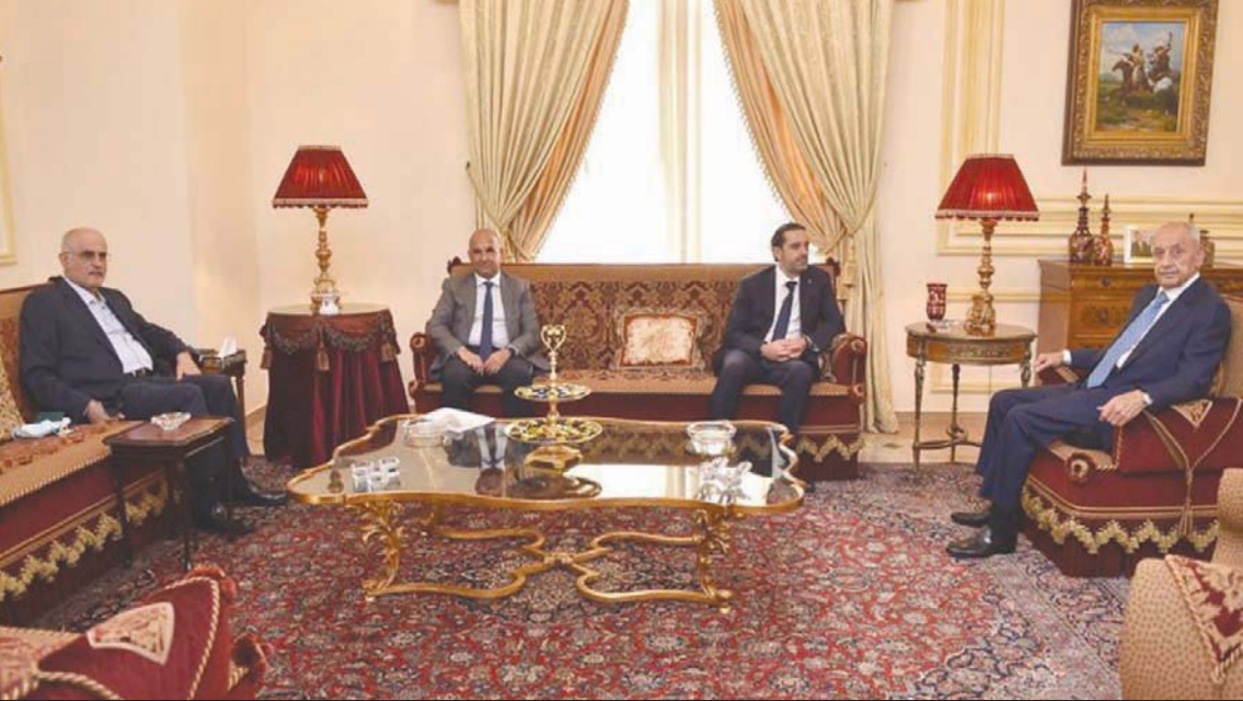
بري والحريري خلال لقائهما أمس

بدورها اعتبرت عضو كتلة «المستقبل» (التي يرأسها الحريري) النائبة رولا الطيش أن فرص تشكيل الحكومة من عرقلتها تكاد تكون متساوية مصيصة في تغريدة لها عبر «تويتر» أن هناك جهة يقودها الرئيس المكلف تجتهد لتذليل كل العقبات داخليا وخارجيا، وجهة يقودها الهوس الرئاسي، تنكسر كل العقبات لتكريس الأوجاج الدستوري والتصدعات السياسية والاستنزافات الاجتماعية.