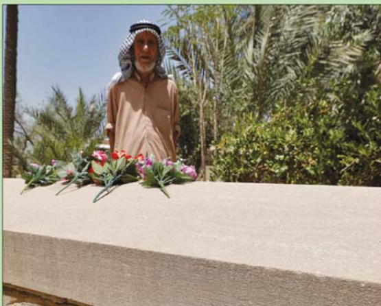
حارس المقبرة يضع ورداً على قبر غيرترود بيل

بغداد - لندن، «التشرق الأوسط» توصف بأنها «أم العراق الحديث»، لكن قلة من العراقيين يعرفونها أو حتى سمعوا بها... إنها غيرترود بيل، الباحثة في علم الآثار والمستكشفة والمصورة والجاسوسة والكاتبة البريطانية التي توفيت في عزلة عام 1926 عن عمر ناهز 57 عاماً وترقد في مقبرة بريطانية ببغداد. وبحسب تقرير لوكالة الصحافة الفرنسية، فإن العثور على المقبرة البروتستانتية في العاصمة العراقية، حيث ترقد مس بيل، ليس بالأمر السهل في بغداد، فيما تحدى قبرها، بحاجة إلى مساعدة حارس الموقع الذي يعرف المكان عن ظهر قلب. إلا أن هذه المرأة أسهمت بنشاط في تأسيس لبنان وحمايته. (تفاصيل ص8)