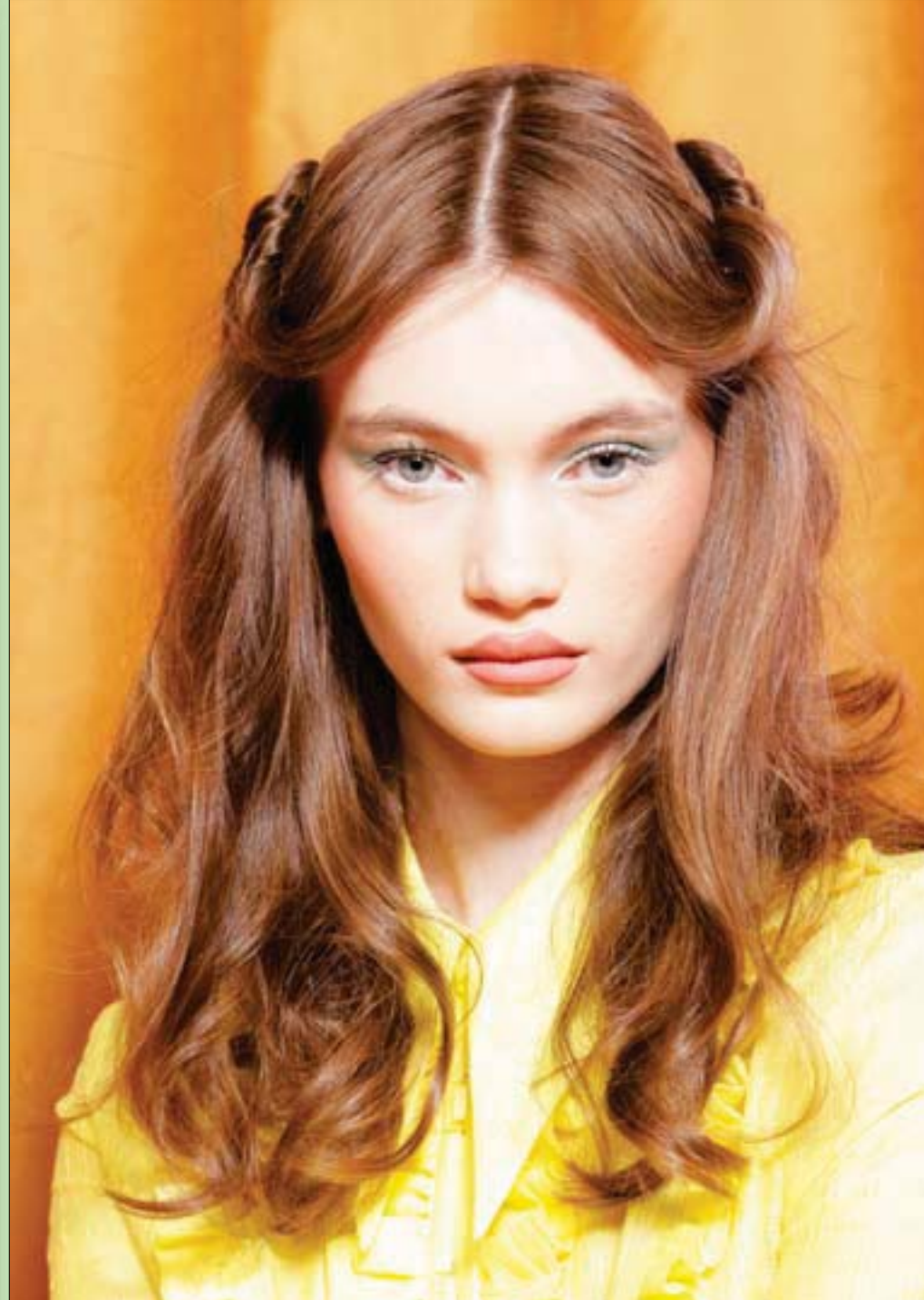
عارضة تقدم زياً من تصميم أليس ماکول ضمن فعاليات أسبوع الموضة بأستراليا المقام في سيدني

ما لي أراكم تملؤون الأرض وتفعمون الجو بالشتائم وتصرخون من فم المنياع نسيتم عدونا المشتركا شنتم الحروب فيما بينكم قولاً يفيض حسداً وبغضا وتصفعون جببة الكارم بكل صوت ناشز الإيقاع وصرتم بعضاً لبعض شركا ودستم العهد الذي يصونكم