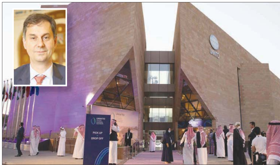
أول مقر إقليمي لمنظمة السياحة العالمية - الرياض (الشرق الأوسط) وفي الإطار وزير السياحة اليوناني هاري ثيوهاريس (تصوير: سعد الدوسري)

● إلى أي حد تستفيد اليونان من العلاقات الفاترة بين تركيا وبعض دول الخليج لجذب أكبر حجم من السياح إليها وسحب البساط من تركيا؟