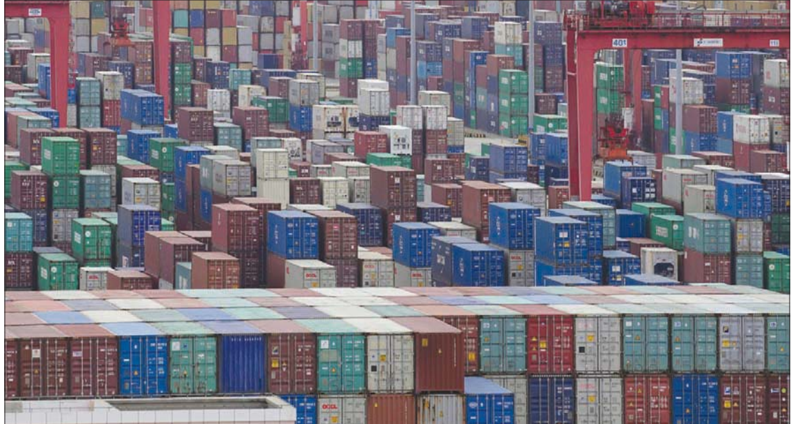
حاويات في ميناء، يانغشان في شنغهاي بالصين