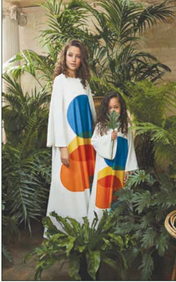
من مقترحات «ليم» للام والابنة