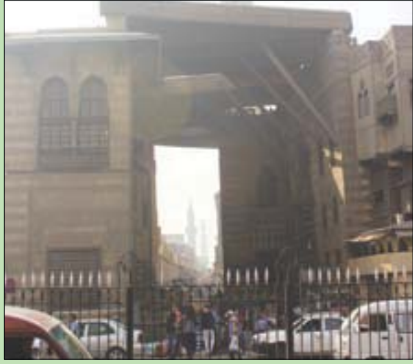
مجموعة الغوري الأثرية بالقاهرة الفاطمية

بشرفاتها المنخفضة ومشربياتها وألوانها الجميلة وفن الأرابيسك وجمالياته المنتشرة في كل مكان، ويضيف الفنان المصري الذي درس الفنون الجميلة في إيطاليا عام 1984 أن هذه الأساليب الثقافية وصلاة التراويح وموائد الرحمن ورقصة التنورة، تزيد من جماليات المكان وتداعب أحاسيس رساميه لإبداع لوحات فنية تحفل بكثير من اللون الفلكلور المصري.