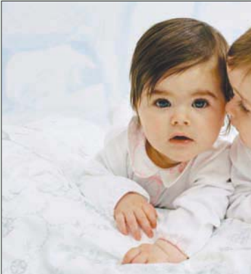
من تصميماً «بيبي ديور»

لكن لا بد من الإشارة إلى أن هذا القطاع ليس بالبساطة التي تظهر بها الأزياء. فهو يخضع لعدة قوانين تتعلق بالسلامة والصحة، أقلها أن الخامات يجب أن تكون بنوعية لا تسبب حساسية أو حكة للجلد والأخذ بعين الاعتبار ألا تتوق أي تفاصيل مثل الأربطة وغيرها، حركة الطفل أو تسبب له الأذى. كل هذه المحاذير والقوانين تُعقد عملية الإنتاج وتجعلها مكلفة، على الأقل بالنسبة للمصممين المستقلين. فبينما يمكن لبيوت مثل «ديور» أو «بيربري» أو «غوتشي» وغيرها أن تُعوض هذه التكاليف برفع أسعارها، فإن أسماء أخرى لا تحظى بنفس التاريخ أو الولاءات، الأمر الذي يحتم عليها طرحها بأسعار تنافسية وإنتاجها بكميات أقل مع ضخمها بجرعات ابتكار أكبر، لتبقى المسألة بالنسبة لهؤلاء الصغار، لأن الأرباح لا تعكس الجهد والوقت المبذول في إنتاجها.