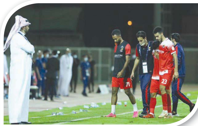
إدارة الوحدة برئاسة تونسي فشلت في إدارة النادي كما يجب ليعود إلى «الأولى»