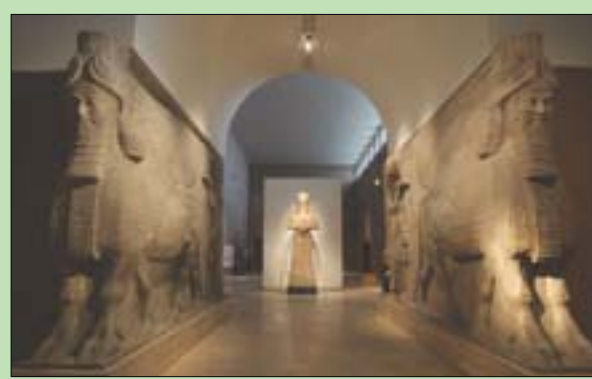
داخل المتحف الوطني ببغداد الذي أسسته غيرتروود بيل