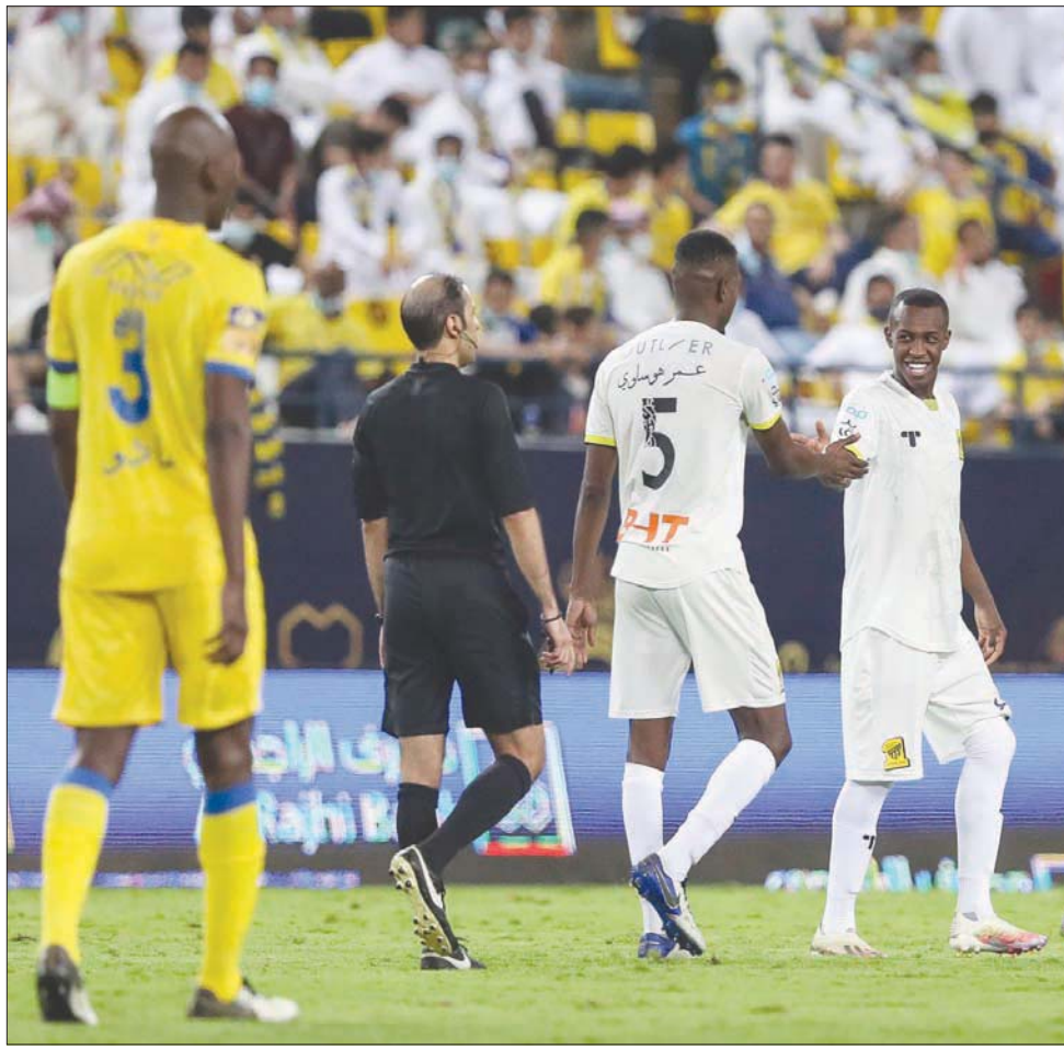
الاتحاديون مطالبون بسداد مبالغ ضخمة لتجاوز قرارات «الانضباط» (المركز الإعلامي لنادي الاتحاد)

وحيث أخطرت اللجنة نادي الاتحاد كتابياً ولم يرد ما يفيد تنفيذ القرار المشار إليه أعلاه، وفرض غرامة مالية قدرها (60,100) ستون ألفاً ومائة ريال تدفع لحساب الاتحاد السعودي لكرة القدم، وذلك لامتناع نادي الاتحاد عن تنفيذ قرار غرفة فض المنازعات الصادر لصالح نادي الفيصل.