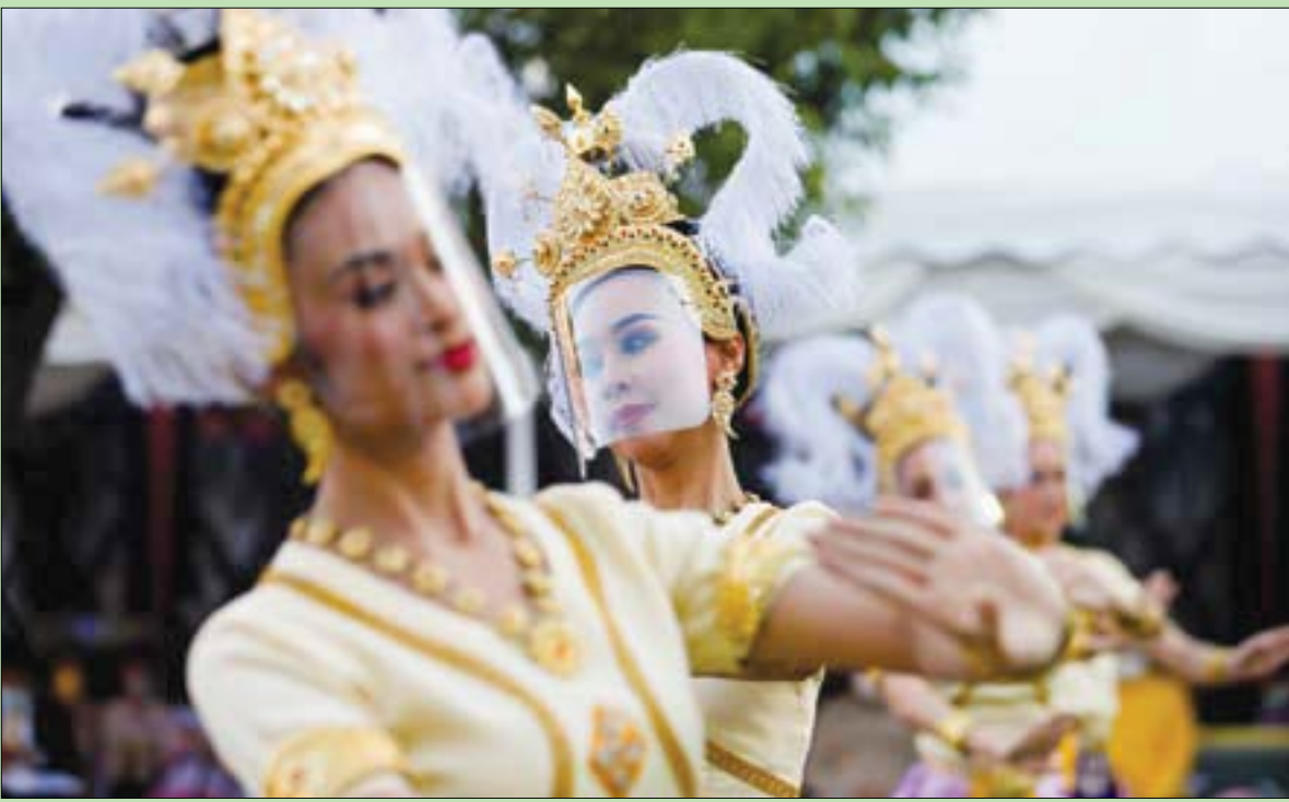
جانب من المراسم الاحتفالية التي أقامها متحف بانكوك الوطني بمناسبة استعادة قطع أثرية من الولايات المتحدة يعتقد أنها سرقت من تايلند منذ أكثر من 60 عاماً