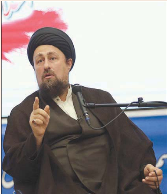
حسن الخميني حفيد المرشد الإيراني الأول يلقي خطاباً في طهران أمس (جماران)

وأضاف: «إذا من المقرر أن يتحدث طرف يجب أن يسمح للطرف الآخر بالتحدث، وإذا من المقرر أن يصل البعض للسلطة، اسمحوا بوجود الجميع» وتابع: «البلاد للجميع، ليست ملكاً لفريق أو مجموعة خاصة، الناس لا يقولون شيئاً حسناً وراءنا». وأفادت وكالة «إيسنا» الحكومية بأن خطاب برنشتكيان واجه احتجاجاً من النواب، واعتبروه «غير لائق» بالبرلمان. وقال أحد النواب المحافظين في هذا الصدد «إذا تحدثنا عن عملية البت باهلية المرشحين، ما قبل به ويؤمن به الجميع هو توصيات المرشد التي تعتبر فصل الخطاب».