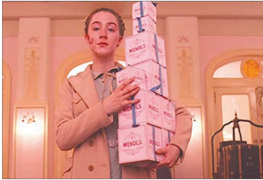
ساويرس رونان في «ذا غراند بودابست هوتل»