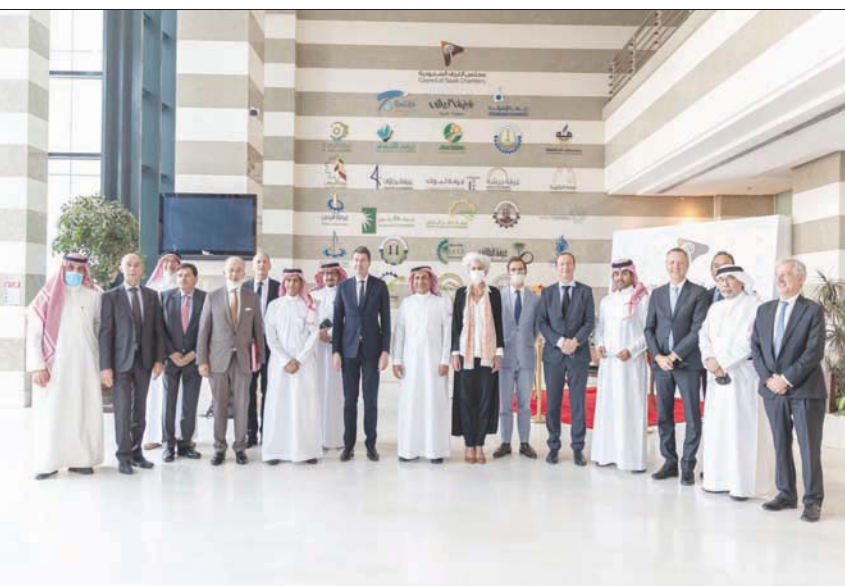
أول وفد تجاري فرنسي يزور السعودية منذ جائحة «كورونا»

والاستقطاب فرانك ريستر للمملكة أبريل (نيسان) الماضي، لاستكشاف الفرص الاستثمارية الجديدة المتاحة للشركات الفرنسية في ضوء «رؤية 2030»، مستفيدة من الشراكة التجارية والاستراتيجية لفرنسا، مبيّناً أن المباحثات مع المسؤولين السعوديين شملت الطاقة المتجددة والصحة والتقنية والترفيه والزراعة. ولفت توازي إلى أن مقومات جعلت منها أهم اقتصاديات المنطقة والعالم لا سيما بوجود رؤية اقتصادية تطرح العديد من الفرص الاستثمارية في مختلف القطاعات والتي تشكل فرصة للشركات الفرنسية داعياً في الوقت ذاته الشركات السعودية للاستثمار في السوق الفرنسية. والسياحة.