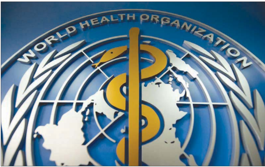
شعار منظمة الصحة العالمية (غيتي)

إلى «الدور القيادي الأساسي» الذي تلعبه منظمة الصحة داخل نظام الأمم المتحدة في مواجهة الأزمات الصحية، موضحاً أن تطورات الأسرة الدولية «تتخطى عموماً القدرات الحالية» للمنظمة. ونص القرار، الذي تم تبنيه في 16 في المائة من ميزانية المنظمة. من جهة أخرى، قررت الدول الأعضاء 1944 عقد اجتماع استثنائي في نوفمبر (تشرين الثاني) المقبل للنظر في صوغ اتفاقية أو معاهدة حول الاستعداد للأوبئة والاستجابة لها، وفق آلية تطالب بها منظمة الصحة وبعض الدول؛ في طلبيتها فرنسا والمانيا.