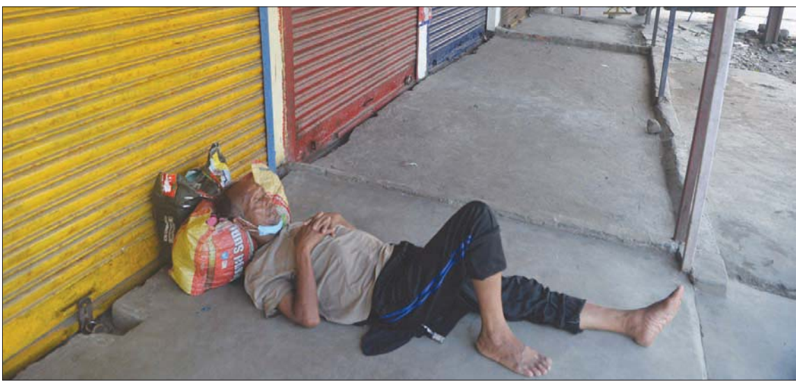
إغلاق الهند أفقد كثيراً من العمال أشغالهم اليومية

إلى البيروقراطية لتنظيم أنفسهم. وفي عام 2009، عندما كانت شبكات التواصل الاجتماعي عبر الإنترنت ما زالت جديدة بالنسبة للكثيرين منا، كان كلوت يتساءل عما إذا كان من الممكن أن تزيد التكنولوجيا من «عدد دنبار»، لذلك طلب من إدارة «فيسبوك» معالجة بعض البيانات. وبعد الفحص، تبين أن الإجابة هي «لا». فموقع «فيسبوك» وما شابه من مواقع التواصل الاجتماعي - قد يتيح لنا إدارة ما هي في الواقع قائمة موسعة من المعارف، إلا أن تلك المواقع لا يمكنها رفع الحد الأقصى للعلاقات الجيدة التي نحافظ عليها، لأن ذلك يبدو أنه أمر بيولوجي، بحسب كلوت.