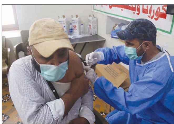
مركز تطعيم في مدينة كراتشي بباكستان

وفي تايلاند، ظهرت آلاف من حالات الإصابة في مصانع ومواقع بناء وسجون. أما ماليزيا فقد أمرت بإجراءات عزل عام شاملة تطبيق اعتباراً من اليوم الثلاثاء لكبح التفشي، وقال مسؤولون إن بعض المصانع يمكن أن تظل مفتوحة لكنها ستعمل أيضاً بطاقة مخفضة.