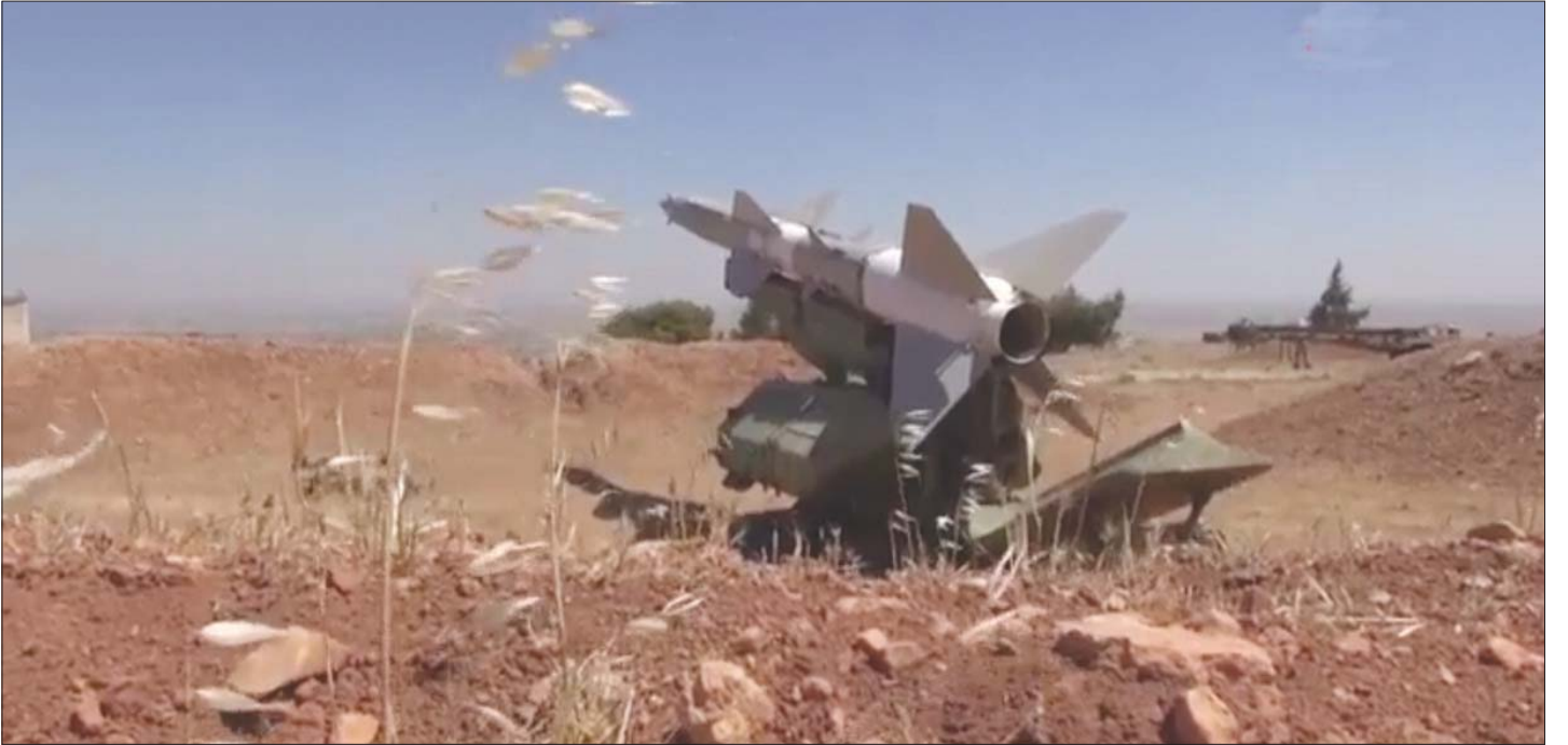
منصة صواريخ روسية خلال مناورات الجيش السوري

يمكن للخبراء تحليل ودراسة جدواها في ميادين وساحات الحروب، وقيام روسيا باختبار أسلحتها في سوريا هو أمر طبيعي لكشف العيوب المحتملة وليس أكثر». وكان وزير الدفاع الروسي سيرغي شويغو قال، إن العمليات في سوريا، «علامة فارقة منفصلة وانطلاقة حقيقية أعطت الجيش الروسي خطوة جادة ونوعية إلى الأمام». وأشار «شام» إلى قول الخبير العسكري الروسي إيغور كوروتشينكو، أن «اختبار الأسلحة الروسية الحديثة على أجساد المدنيين ومنازلهم في سوريا، خطوة طبيعية كونها تستخدم في ظروف الحرب الحقيقية للكشف عن العيوب المحتملة فيها». وقال الخبير في تصريح لوكالة «سبوتنيك»: «اختبار الأسلحة الفعلي يكون خلال المعارك الحقيقية، حيث