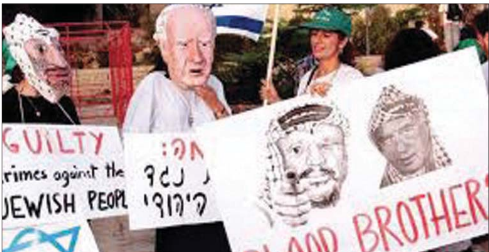
لافقتات ضد أطراف حكومة التغيير التي قد تعلن قريباً تلبسهم الكوفية الفلسطينية

بتشكيل حكومة ستتنتهي في منتصف الليلة القادمة، الأربعاء - الخميس، وفي حال تشكيل «حكومة التغيير»، تفديرت بأنه سيتم تخصيص الحكومة في اليوم نفسه، أو إبلاغ الرئيس الإسرائيلي، رؤويين رفلين، بالنجاح بتشكيل حكومة والحصول على مهلة أخرى من سبعة أيام قبل طرحها على الكنيست. لكن لبينيت يسعى إلى طرح الحكومة على الكنيست وتخصيها قبل نهاية مهلة كهذه، تحسباً من قيام نتنياهو واليمين باستغلال الأسبوع لمواصلة الضغط على بينيت وساعر. ويخشى فريق التغيير، أن يقدم رئيس الكنيست، ياريف ليفين، المقرب من نتنياهو، على تأجيل البحث في الكنيست حتى اللحظة الأخيرة التي يتحدا القانون وهو سبعة أيام، كي يعطي الفرصة لمزيد من الضغط.