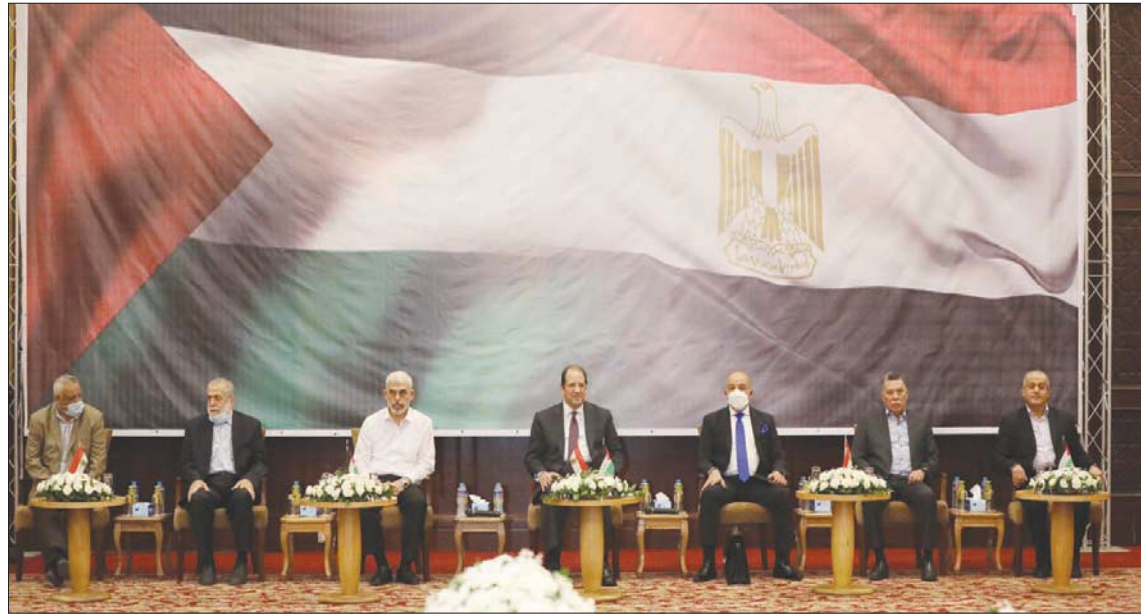
رئيس المخابرات العامة المصرية عباس كامل يتوسط ممثلي الفصائل الفلسطينية في غزة أمس

لمحت إلى صفقة قريبة لتبادل أسرى مع إسرائيل