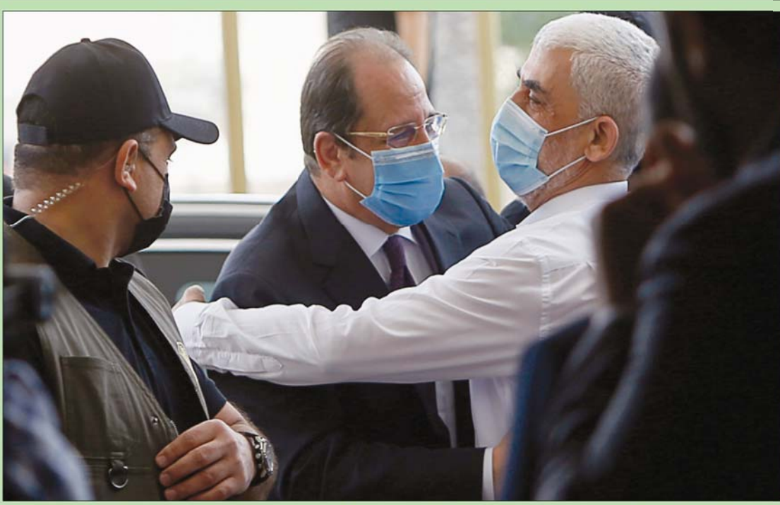
رئيس المكتب السياسي لـ«حماس» في قطاع غزة يحيى السنوار يرحب بحرارة برئيس المخابرات العامة المصرية عباس كامل أمس (إبأ)

أبدى المبعوث الأممي لليمن مارتن غريفيث في صنعاء أمس تفافلاً بنجاح خطته للسلام في اليمن، رغم إشارته إلى الإحباط الذي يشعر به جراء تعثر جهوده منذ عام ونصف العام. ودعا غريفيث الأطراف اليمنية إلى تقديم تنازلات، كما أكد أهمية وقف الهجوم على محافظة مأرب. وفي ختام زيارته إلى صنعاء ولقائه زعيم الجماعة الحوثية عبد الملك الحوثي، قال غريفيث إن خطته تقوم أولاً على «إزالة كل العقبات التي تحول دون حصول اليمنيين على الغذاء والسلع الأساسية، بما في ذلك الوقود، بغرض الاستخدام المدني». كما شدد غريفيث على «الحاجة الماسة لوقف إطلاق النار على مستوى البلاد لتخفيف وطأة الوضع الإنساني، وفتح الطرق أمام حركة الأشخاص والسلع بحرية، وإعادة الحياة الطبيعية إلى ملايين اليمنيين». وقال أيضاً إن «استمرار الأنشطة العسكرية في العديد من أنحاء البلاد، بما في ذلك في مأرب، يقوض فرص السلام في اليمن، ويعرض حياة الملايين للخطر، ويجب أن يتوقف». وأكد غريفيث أهمية انتهاز «الإجماع الدبلوماسي» لدعم مفاوضاته. وخلص إلى القول: «بعوتنا بسيطة للغاية: أوقفوا الحرب، وأوقفوا احتمالات المكاسب العسكرية، وأنهوا النزاع، وابتوا سلاماً لليمن، واجعلوا اليمن مكاناً للشعب اليمني». في غضون ذلك، اتهم الرئيس اليمني عبد ربه منصور هادي، أثناء استقباله وزير الخارجية السويدية آنا ليند في الرياض أمس، الميليشيات الحوثية بأنها «لا تؤمن بالتعايش والسلام وأنها لا تجيد غير لغة السلاح».