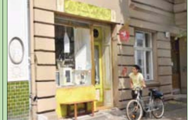
صيدلية الفن في برلين أحد معالم مهرجان «48 إتش نويكولن»

باريس، «الشرق الأوسط» بعد شهور عدة من الغلق جراء الجائحة ترحب متاحف فرنسا بعودة عشاق الفن بالعديد من المعارض الكبيرة الجديدة لكبار الفنانين العالميين على أمل تعويض أشهر طويلة من انعدام الإيرادات. وبحسب وكالة (د.ب.أ.) يأتي معرض «بيكاسو - رودان» في