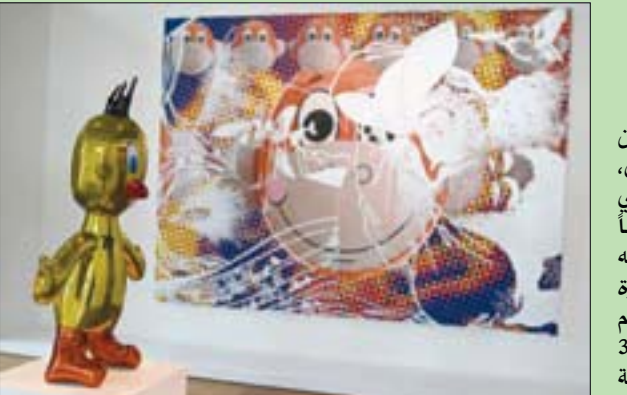
من أعمال الفنان الأميركي جيف كونز

باريس على قائمة المعارض الجماهيرية ويعتبر «أحد أهم المعارض منذ بداية الجائحة. وهذا المعرض المزدوج الذي افتتح في 19 مايو (أيار) هو أول مشروع مشترك بين متحف بيكاسو ومتحف رودان. وتعرض التماثيل والأعمال الورقية التي صممها رودان (1840 - 1917) في متحف بيكاسو بينما توجهت لوحات وتماثيل بيكاسو (1881 - 1973) إلى متحف رودان. ويستمر المعرض المزدوج حتى يناير (كانون الثاني) 2022. وفي متحف الثقافات الأوروبية والمتوسطية بمارسيليا يقام معرض لأعمال الفنان العالمي جيف كونز الذي تعد أعماله بين المعارض الأكثر قيمة بين الرسامين الأحياء منذ بيع تماثله الفولادي «الأرنب» في مايو 2019 بنحو 81 مليون يورو (99 مليون دولار) في مزاد. وبين أعمال أخرى، يضم المعرض تماثله الفولادي «الكلب البالون» الذي يشبه كلباً مصنوعاً من البالونات، وتماثله الشهير «القلب المعلق» وهو عبارة عن قلب فولاذي به سهم. وقام بعرضهما إلى جانب نحو 300 عمل من مجموعة المتحف الفرية لمفردات اليومية من عصور مختلفة.