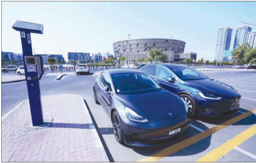
قدمت دبي خلال السنوات الماضية حوافز ومميزات لاستخدام وسائل نقل عديمة الانبعاثات

وأوضحت هيئة الطرق والمواصلات في دبي أن خريطةها تتواءم مع التوجهات الاتحادية الرئيسية، بما فيها استراتيجية الإمارات للتنمية الخضراء 2030 وأجندة الإمارات الخضراء لعام 2030 والخطة الوطنية للتغير المناخي 2050 واستراتيجية الإمارات للطاقة 2050 ورؤية الإمارات 2021 والاستراتيجية الوطنية للابتكار ومئوية الإمارات 2071. وكذلك التوجهات المحلية لإمارة دبي، مثل استراتيجية دبي المتكاملة للطاقة 2030، واستراتيجية دبي للمدينة الأقل بصمة كربونية على مستوى العالم بحلول عام 2050. بالإضافة إلى المواومة مع التوجهات العالمية مثل اتفاقية الأمم المتحدة المناخية بشأن التغير المناخي وأهداف التنمية المستدامة، وشبكة للمدن القيادية للحد من ظاهرة التغير المناخي.