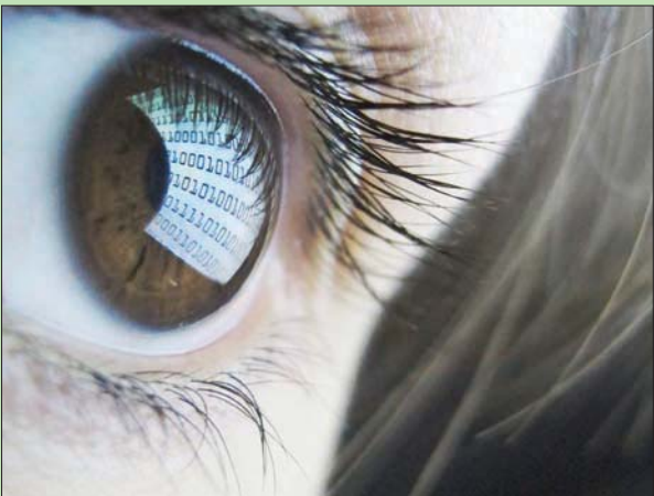
قضاء، يوم طويل أمام الشاشة يرهق العين