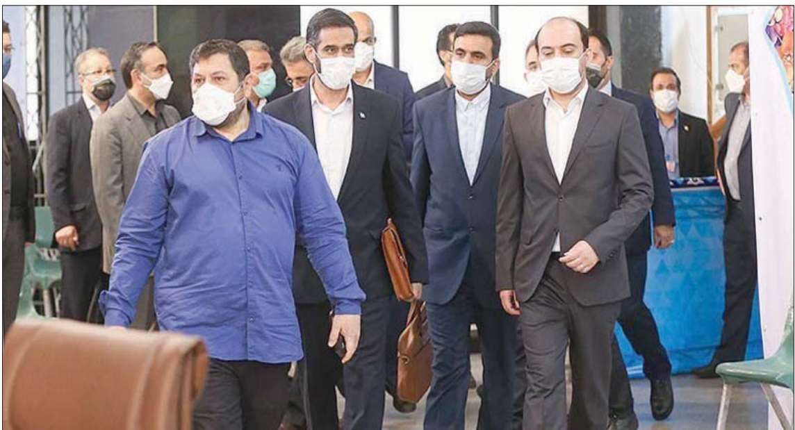
الجنرال سعيد محمد مستشار قائد الحرس الثوري محاطاً بفريق حمايته لدى تقديمه طلب الترشح للانتخابات الأسبوع الماضي

وكان لاريجاني، خلفاً لروحاني في منصب الأمين العام للمجلس الأعلى للأمن القومي الإيراني بين عامي 2004 و2006، وتولى التفاوض حول المصالحة الإيرانية مع التريوكا الأوروبية قبل إحالة إيران إلى مجلس الأمن وإصدار القرار 1737، في نهاية ديسمبر (كانون الأول) 2006، الذي حظر توريد التكنولوجيا النووية لإيران، وفرض عقوبات على شركات صناعية في تخصص اليورانيوم الإيراني، وهو القرار