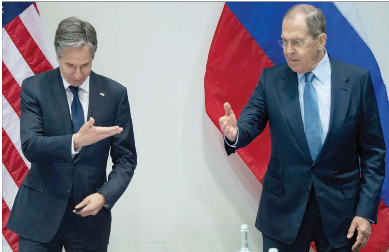
وزير الخارجية الأميركي أنتوني بلينكن (يسار) والروسي سيرغي لافروف خلال اجتماع شهد مناكفات

وقال الناطق باسم الخارجية الأميركية في بيان إن بليكن عبر أيضاً خلال اللقاء الذي استمر نحو ساعتين مع لأفروف، عن مخاوف الولايات المتحدة بشأن صحة المعارض الروسي اليكسي نافالني و«قمع» منظمات النائب الإسباني ناتشو سانشيز أمور، أن