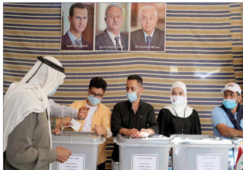
سوريون يقترعون في سفارة بلادهم ببيروت أمس

3 مرشحين هم الرئيس السوري الحالي بشار الأسد والمحامي محمود مرعي وعبد الله سلوم سلوم. وتحدث عدد من السوريين الذين اقتروا «الشرق الأوسط» عن تعرضهم للمضايقات ليل اليوم المحدد للتصويت، إذ تمّ تهديدهم بهدف منعهم من التوجه إلى السفارة والانتخاب، كما تعرض عدد منهم للضرب إذ قام عدد من الشبان بالهجوم على الحافلات التي تقلهم في غير منظمة. وكان وقع إشكال كبير صباح أمس على أوتستراد جونبة - نهر الكلب (شمال بيروت)، حيث أقدم شبان لبنانيون على الهجوم على حافلات نقل سوريين ونزعو الصور والأعلام واللافتات المؤيدة للأسد. وأظهرت مقاطع فيديو تضارياً وتدافعاً وتكسير زجاج سيارات ما أدى إلى سقوط جرحى قبل حضور الجيش اللبناني الذي طوق المكان. وفي ساحة ساسين في الأشرقية (شرق بيروت)، سبّج