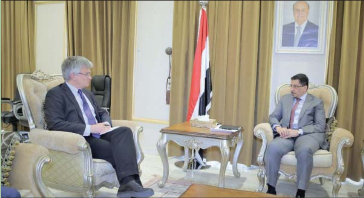
وزير الخارجية اليمني لدى لقائه المبعوث السعودي إلى اليمن في الرياض أمس (سبأ)

إيجاز المهمة». وأضاف أنه «من خلال تسييس المناقشة، يخاطر الحوثيون بإلحاق مزيد من الأذى بشعب اليمن وإحداث أضرار بيئية هائلة في المنطقة». وحسب دراسات عدة، يندر وضع الناقلة «صافر» بكفاءة بيئية وإنسانية قد تشمل تدمير صحة وسبل عيش ملايين الأشخاص الذين يعيشون في 6 بلدان تمتد على طول ساحل البحر الأحمر.