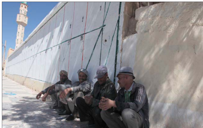
قفور شعبي ميّن حملة انتخابات البرلمان الجزائري التي انطلقت أمس (إ.ب.)

غياب لافت لأحزاب المعارضة اليسارية واللائكية المعارضة، وأهمها «جبهة القوى الاشتراكية» و«حزب العمال»، و«التجمع من أجل الثقافة والديمقراطية».