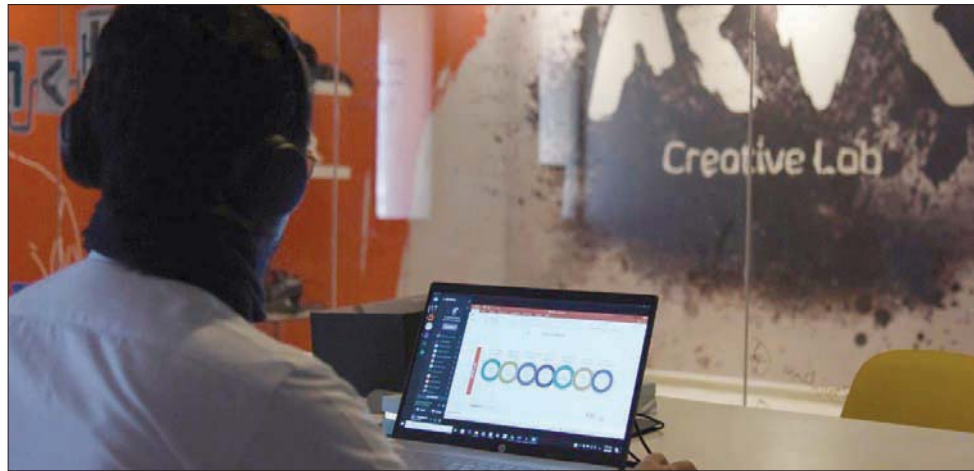
الاقتصاد التشاركي يسجل تضاعفاً في أعماله المختلفة في السعودية

في المملكة، حيث سعت إلى متابعة بيانات التطبيقات عبر إنشاء منصة للمؤشرات وإصدار وثيقة حوكمة تصاريح النقل الخاصة بالمتاجر وإطلاق الدليل الشامل الإرشادي للإجراءات الوقائية الخاصة بمقدمي عمل جديدة مرنة. ووفقاً للتقرير، أصدرت الهيئة التنظيمات اللازمة لتطبيقات التوصيل لتحفيز الشركات الناشئة وضمان توفير الإجراءات الوقائية وزيادة الطاقة الاستيعابية خلال فترة جائحة كورونا بشكل رسمي وتمكن المستثمرين من الاستفادة من نماذج الأعمال المبتكرة تحت مظلة الجهات الرقابية، بالإضافة إلى المستخدمين من خلال الحصول على الخدمات في بيئة ضمن حقوقهم، ومن جانب آخر رواد الأعمال لخلق نماذج