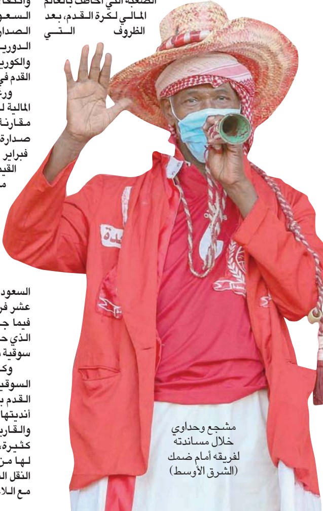
مشجع وهدايا خلال مساندة لفريقه أمام ضمك (الشرق الأوسط)

سجلت جماهير الدوري السعودي حضوراً صاخباً في أول أيام عودتها للمدركات، وذلك بعد غياب طويل، وتحديداً منذ تعليق دخولها في 7 مارس (آذار) 2020، بسبب تفشي جائحة «كورونا». وشهدت ملاعب كرة القدم السعودية، الأربعاء والخميس، عودة الجماهير للمدركات بنسبة 40 في المائة لطاقتها الاستيعابية، ومن جهتها، استقبلت الأندية، وعلى الأخص المنافسة على اللقب، جماهيرها بأفضل طريقة، فانتصر الهلال على ضيفه الأهلي بخماسة، وكذلك منافسة الشباب على ضيفه العين بالنتيجة ذاتها. ورغم الإجراءات غير المألوفة بالنسبة للجماهير في ملاعب كرة القدم، فإنها أثبتت دورها على أكمل وجه؛ فحضرت بكمصان فرقتها وأدائها التشجيعية، وملاط ورابط الأندية والمدركات طرباً وصخباً لتسجل حضورها اللافت في منافسات الدوري الأقوى على مستوى المنطقة العربية والخليجية. وعادت الحياة مجدداً لملاعب كرة القدم التي ظلت خاوية إلا من لاعبي الفرق ومدربيها وعدد محدود من مسؤولي الأندية، بعدما كانت المدرجات تجم بالآلاف من عشاق كرة القدم في السعودية. وطرحت تذاكر مباريات الجولة الـ28 في دوري كأس الأمير محمد بن سلمان للمحترفين، عبر منصة «تذاكر السعودية» والمنصات