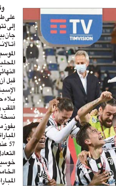
بوفون قائد يوفنتوس يرفع كأس إيطاليا بين زملائه على منصة التتويج في ظهوره الأخير مع الفريق

أندية إيطالية. وعندما نال لقبه الأول في كأس إيطاليا في 1999 مع نادي بارما كان بوفون يلعب مع إنريكو كيزا الذي أحرز تجله فيديريكو هدف الفوز على