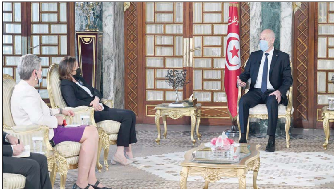
الرئيس سعيد خلال لقائه وزيرة داخلية إيطالية والمفوضة الأوروبية للشؤون الداخلية أمس

الهجرة غير الشرعية الشائكة، خلال لقاءها رئيس الدولة قيس سعيد، ورئيس الحكومة هشام المشيشي، ووزير الخارجية عثمان الجرندي. وتصدر موضوع الهجرة غير الشرعية جدول أعمال الوزارة في تونس في ظل الزيادة الكبيرة في أعداد المهاجرين المنطلقين من السواحل التونسية نحو السواحل الإيطالية.