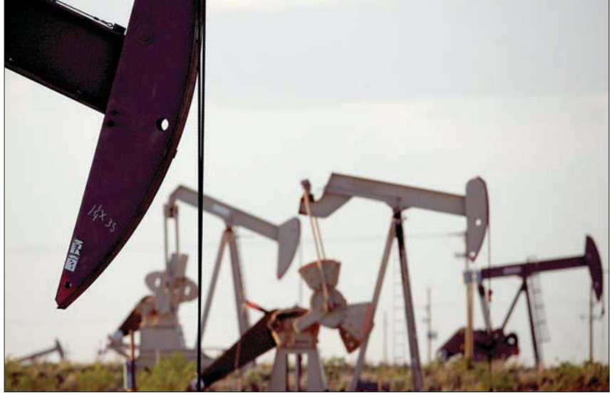
شهدت أسواق النفط أمس تذبذباً شديداً للأسعار

وتراجعت الواردات من روسيا أيضاً في أبريل مقارنة بالشهر السابق إلى 6,3 مليون طن، أو 1,53 مليون برميل يوميا، وذلك بالتزامن مع تراجع مشتريات الخام الصينية، إذ واجهت المصافي تراجعاً في هوامش الربح. وانخفض إجمالي واردات النفط الخام إلى الصين، أكبر مشتر في العالم، 0,2 في المائة على أساس سنوي في أبريل، إلى أدنى مستوى منذ ديسمبر (كانون الأول).