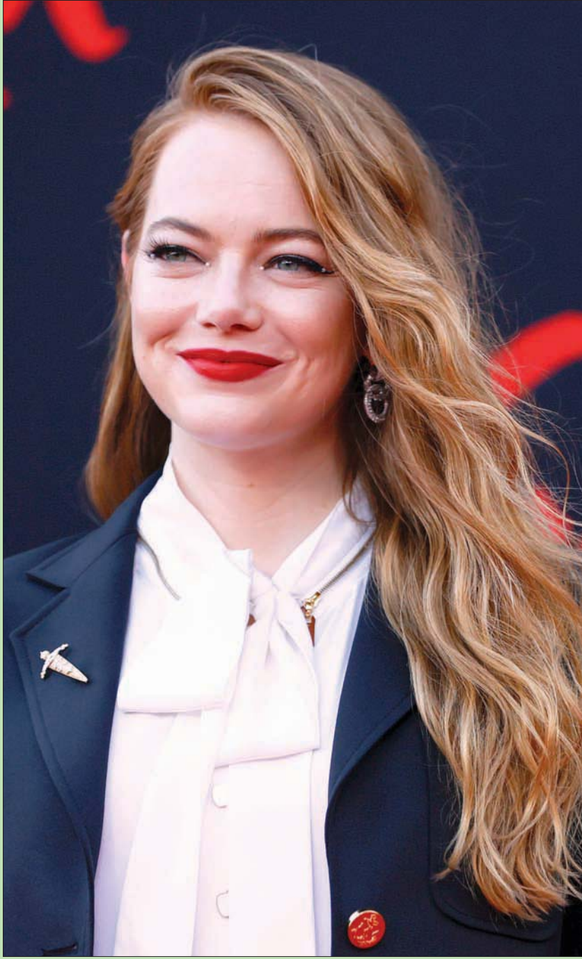
المثلة الأميركية إيما ستون لدى حضورها العرض الأول لفيلم «كرويانا» في لوس أنجلوس بكاليفورنيا

لاحظوا هذا العنوان الذي صاغته أنامل «بي بي سي» العربية تعليقاً على تصريحات وزير الخارجية اللبناني، المقال، شربل وهبة. العنوان يقول: «وزير خارجية لبنان يغضب الخليجين بتصريحات عن تنظيم الدولة والبدو». لن أعقب على وصفهم لـ «داعش» بتنظيم الدولة، فهو موضوع جدلي، يحتاج فيه من يحتاج باسم المهنية والحيادية، وأن نطلق على كل طرف وفريق ما يطلقه على نفسه، وليس ما يطلقه الإعلام المعادي له. يعني هذا الأساس لا يجوز لنا وصف الحزب الاشتراكي الاجتماعي الأثاني بالنازي... لكنهم لا يفعلون! على كل حال، يهمني الشق الثاني من العنوان، وهو أن استهزاء شربل، باهل الجزيرة العربية - بوصف السعودية وهي أكبر دولة والمعتدبة بسباق حديث العبقري التاريخي شربل - هو أمر - طبقاً لعنوان «بي بي سي» - أغضب السعوديين وربما أهل الخليج، وحسب. هذا النوع من الصياغات الملتغمة، تعتر عن أصل الداء وموطن البلاء في تلافيف الدماغ المعادي للسعودية، للأسف، من بعض العرب، ف«بي بي سي» العربية، كما هو واضح، تدار وتصاغ من هؤلاء.