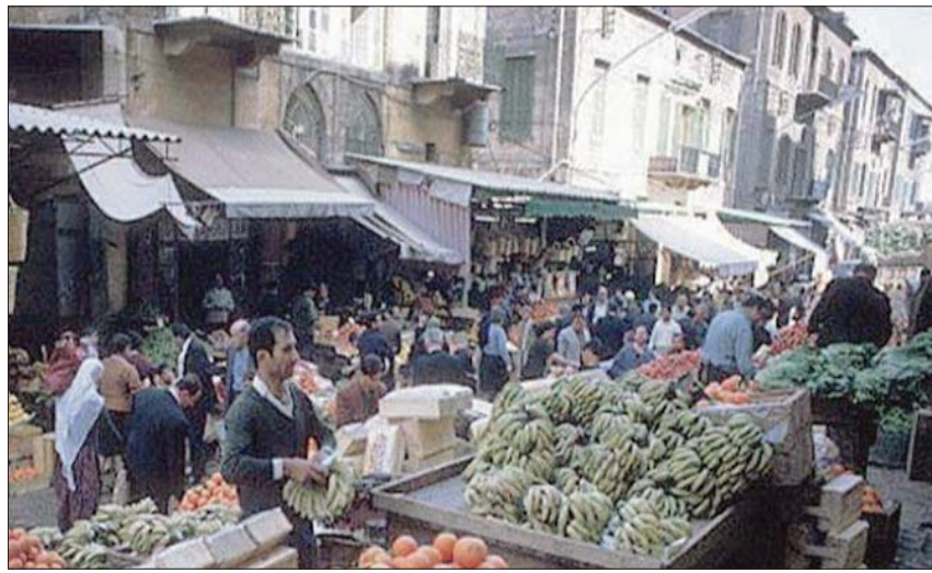
سوق النورية من أسواق بيروت القديمة

في المستقبل القريب، فنعيد من خلالها نبض الحياة لوسط بيروت، كما نستحدث من خلالها متنفساً للبيانيين يحتاجون إليه. ففتح لهم التغيير وخوض تجربة تسوق جديدة، لا تشبه تلك في محلات السوبرماركت المغلقة.