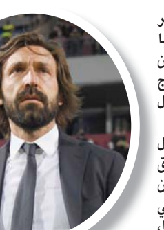
بيرو وشكوك حول مستقبله مع يوفنتوس