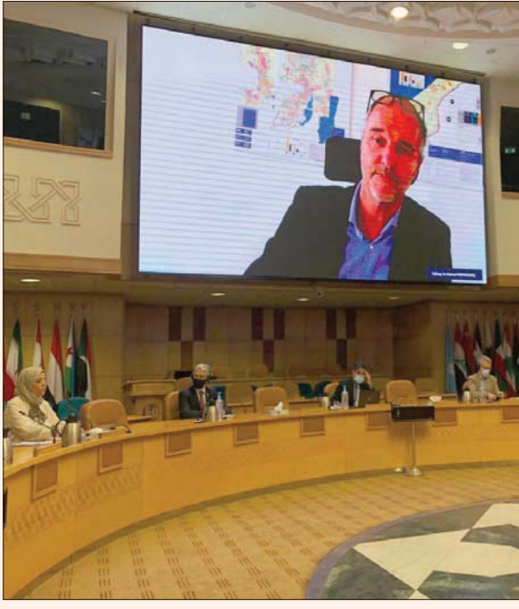
جانب من المؤتمر الصحافي الافتراضي حول تطورات الوباء، في شرق المتوسط

وأوضح أن إغلاق نقاط دخول وخروج المرضى وفتح العمل الصحي الإنساني، وفرض قيود صارمة على دخول الإمدادات الطبية، سيؤدي إلى تفاقم أزمة الصحة العامة في القطاع. وأشار إلى أن الضفة الغربية شهدت هي الأخرى عرقلة وصول الفرق الطبية إلى المصابين، وضرب الإمدادات الطبية، بما فيها الخاصة بـ«كوفيد - 19»، لكنها تختلج السجون بالدخول. وقال إنه لا توجد الآن فرصة للدخول إلى غزة، باستثناء معبر رفح، مشيراً إلى أنه قد تم التمسك مع السلطات المصرية بشأن إرسال شحنة استغاثة. وأعرب بيبركون عن قلقه من الصعوبات التي تواجه قوافل الإغاثة إذا سمح لها بالدخول مستقبلاً بسبب ما حدث من تدمير للطرق، قد يؤثر على قدرة سيارات الإسعاف في الوصول إلى المناطق المنكوبة.