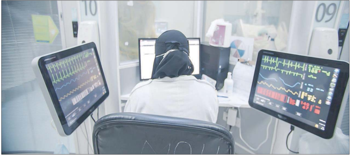
عاملة صحية تتابع حالات «كورونا» المنومة في أحد المستشفيات السعودية