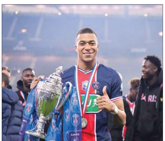
مبابي له الفضل في تنويع سان جيرمان بالكأس

واعترف بيرلو بأن مهمته التدريجية الأولى في مسيرته شهدت العديد من الصعوبات، مشيراً إلى أن الانتصارات لا تحجب فترات الصعود والهبوط هذا الموسم. وأضاف: «لأقمت أداءً لا عادي في فريقنا هذا الأمر يرضني جداً كمدرّب بعض النقاد عن الشائعات في الصحف». وكان بيرلو تسلم منصبه خلفاً لماوريتسيو ساري مطلع الموسم الحالي، لكن الفريق فقد لقبه بطلاً