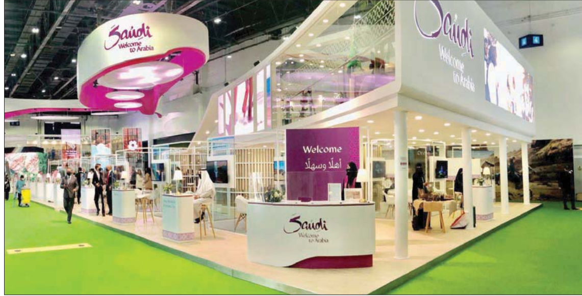
قطاعات سعودية تنهي مشاركتها الفاعلة في معرض سوق السفر العالمي بدبي