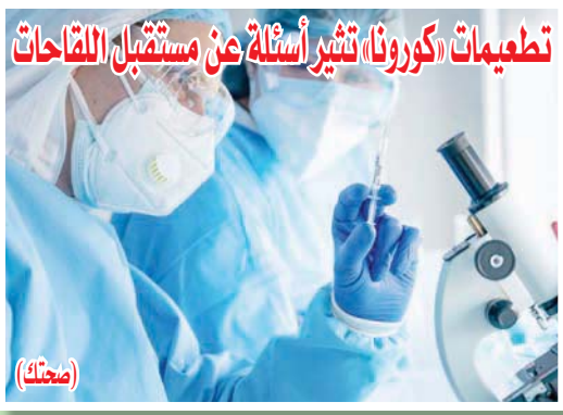
تطعيمات كورونا، تشير أسئلة عن مستقبل اللقاحات