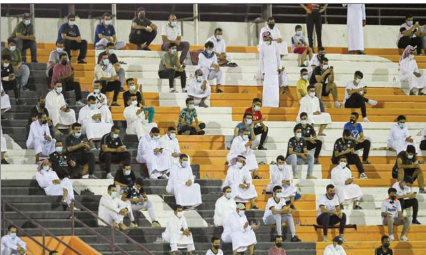
جماهير الشباب سجلت حضوراً جيداً في ملعبها