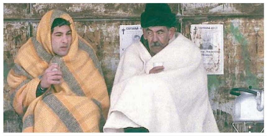
علاقة متناقضة: «الرحلة الكبرى»