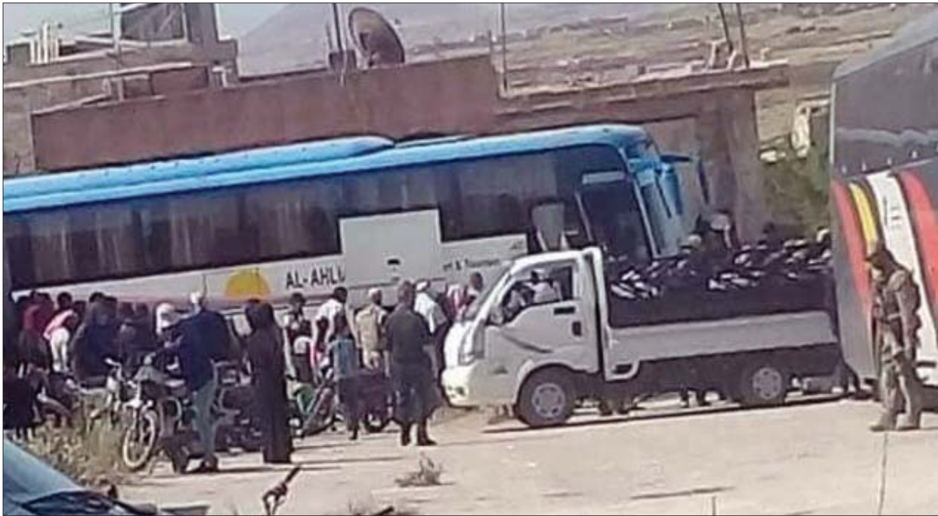
حافلات لنقل سوريين من ريف القنيطرة جنوب البلاد إلى شمالها

على نقطة عسكرية تابعة للمليشيات الإيرانية في قرية الدوحة الواقعة بين تل الشعار وقرى جبا وأم باطنة وممنعة، قرباً من السياح الحدودي الفاصل بين سوريا والأراضي التي تحتلها إسرائيل. وردت قوات النظام على الهجوم بقصف مدفعي من تل الشعار على بلدة أم باطنة، ما أدى إلى نزوح أعداد من الأهالي نحو القرى المجاورة، كما تم فرض حصار على البلدة وإغلاق مداخلها، مع التهديد باقتحامها عسكرياً ما لم يتم تسليم 30 شاباً من المطلوبين.