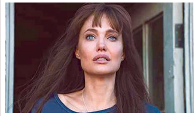
قلق في عيني أنجلينا جولي في «أولئك الذين يتمنون موتي»

كان الأفضل لو أن الفيلم اعتمد على زاوية واحدة: الصبي الهارب (وهو محور الرواية في الأصل) أو القاتلين أو الشريف وزوجته أو هانا. الرواية التي وضعها مايكل كوريتا التزمت بحكاية الصبي لكن الفيلم لم يفعل. ما أفقد الفيلم محوره ووضع هانا وشخصيتها في صف مواز، مضيقاً لتفاعلهما العناية بالصبي في