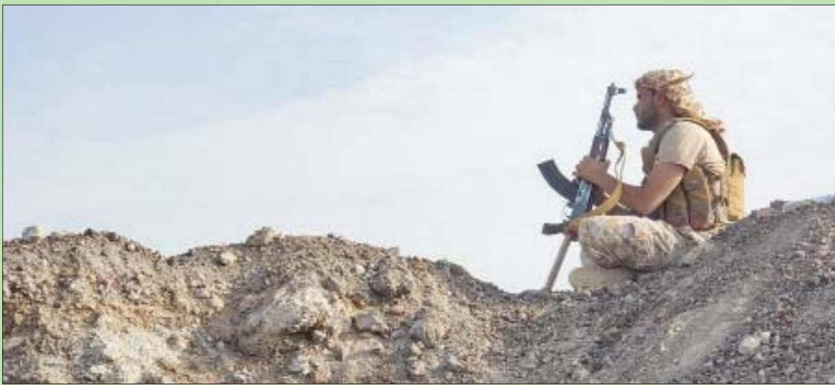
جندي من الجيش اليمني في إحدى جهات مارب

وأنا اعتبر ذلك بمثابة مشاركة بناءة، وقد تم تفويضني للسفر أثناء صعوبة المرحلة في ظل تفشي جائحة (كورونا)». وأضاف «كما تعلمون، الحوثيون لهم دور مهم يلعبونه في اليمن. ونحن حريصون على تجاوز الصراع العسكري، حتى يتمكن الحوثيون من لعب هذا الدور والبدء في الحديث عنه. لا بد من محادثات حقيقية وجمع اليمينيين معا لتقرير مستقبل بلدهم، ليس لنا أو للأمم المتحدة أو لأي شخص آخر مصلحة أخرى في عمل أي أمر آخر غير تسهيل ذلك. واعتقد أن المجتمع الدولي لديه مسؤولية حريصة على الاجتماع، لإنشاء تلك المنصة حتى يتمكن اليمينيون من التحدث معاً، ولكننا نعد