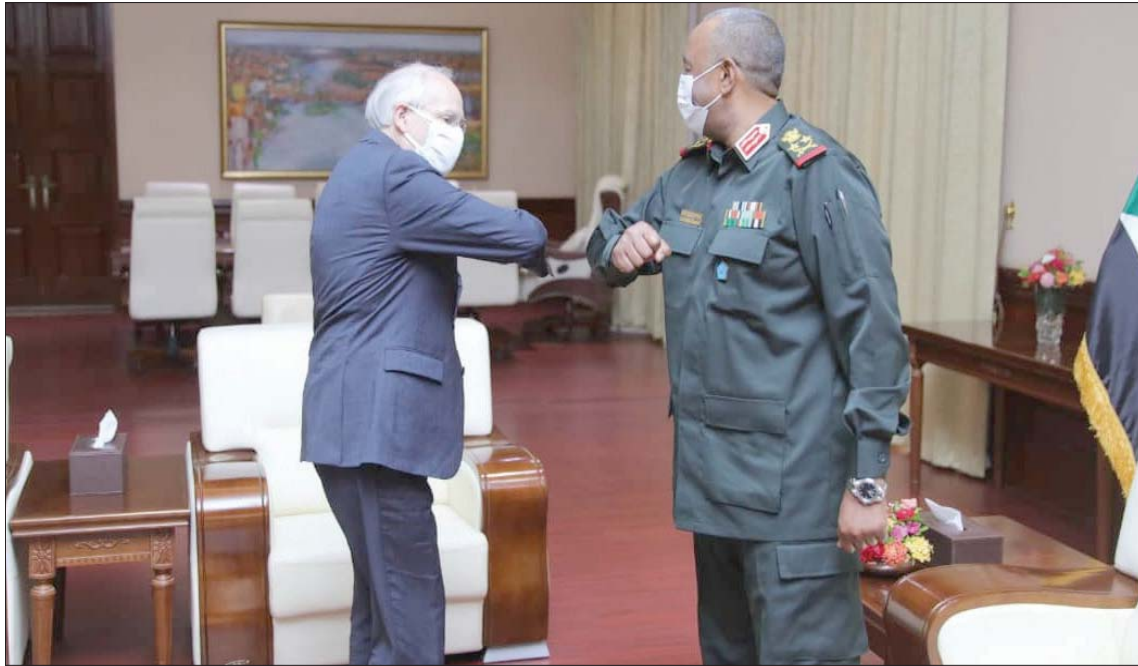
بوث خلال لقائه البرهان في الخرطوم في مارس الماضي

واشنطن، معاذ العمري كشف السفير دونالد بوث، المبعوث الأميركي الخاص إلى السودان وجنوب السودان، عن اعتراف الولايات المتحدة رفع الحصانة الاستثمارية للشركات الأميركية في السودان، وذلك في مجالات الزراعة والبنية التحتية والطاقة وتقنية المعلومات، معلناً تخصيص الكونغرس الأميركي مبلغ 716 مليون دولار دعماً للسودان، والتأكيد على رفع مستوى العلاقات مع السودان على المستويات كافة، لدعمه في عملية التحول الديمقراطي.