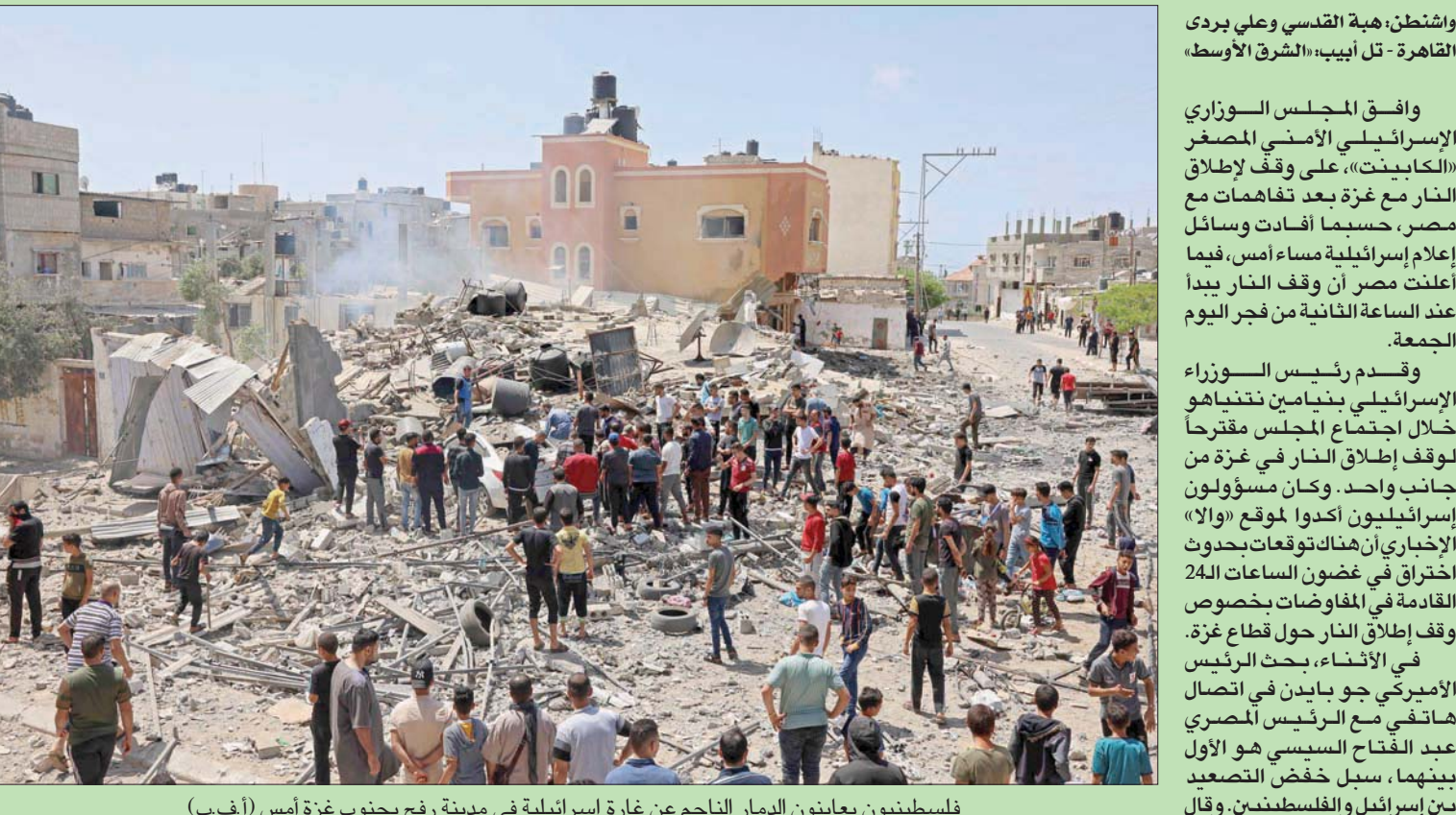
فلسطينيون يعاينون الدمار الناجم عن غارة إسرائيلية في مدينة رفح بجنوب غزة أمس

اشتبكات في بيروت بين لبنانيين وموالين للأسد روسيا تهجر معارضين سوريين من «الجيب الإيراني» إلى «الدرع التركية» رعت القوات الروسية، أمس، تهجير 150 سوريا معارضاً من ريف القنيطرة جنوب البلاد، التي تعد «منطقة نفوذ إيراني»، إلى مناطق خاضعة لسيطرة موالية لتركيا، تسمى «درع الفرات» في شمال سوريا.