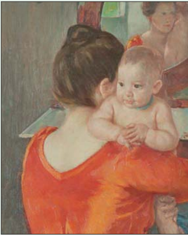
لوحة «الطفل تشارلز فوق كتف والدته» للغناة ماري كاسات (سودبيز)