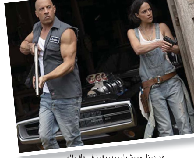
فن دبزل وميشيل رودريغيز في «إف 9»