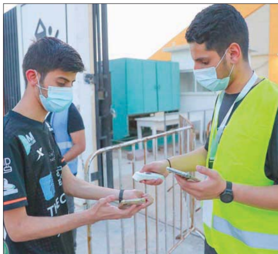
التأكد من تطبيق اشتراطات الدخول لأحد المشجعين