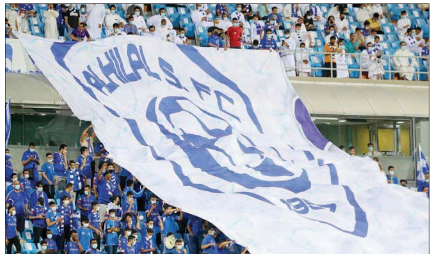
الهلال استقبل جماهيره بخماسة تاريخية في الأهلي

الأولى من ناحية قوة المنافسة والقيمة السوقية، ما يتعكس على أداء المنتخب السعودي الأول. ويعود هذا المنحرج لأمر محمد بن سلمان ولي العهد ورجل الرياضة الأول في المملكة، من خلال دعمه المالي السخي والمخوّل، وتوجيهاته التي تصب في صالح تطوير الكرة السعودية. وتفوق الدوري السعودي على الدوريات الآسيوية والعربية يُعد هدفاً طبيعياً وغير مستغرب، ويبقى الهدف الأساسي الذي يبتعد عنه قيادة الرياضة السعودية، «المركز الخامس عالمياً»، وهو ما يعني تحرك القطر الرياضي السعودي من ناحية النقل التلفزيوني، وعوائد الأندية المالية والخصخصة، حتى يقف الدوري السعودي في مصاف دوريات الدول الأوروبية المتقدمة رياضياً.