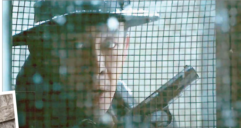
مشهد من الفيلم الصيني «مُغلق»

وحالياً ما زالت القيادة في الصين بيد أفلامها المحلية: «مُغلق» (جديد) المخرج زانغ ييمو يقول هناك: فيلم مغامرات وتشويق يحمل بعض السياسة: أربع من موظفي الحزب الشيوعي في اللاتينيات يجدون أنفسهم وسط مخاطر طريق بسبب خيانة أحدهم. في الجوار أفلام أكثر رسمية حول فساد شهدته البلاد عندما استطاعت إحدى المؤسسات شراء عقارات غير مخصصة للبيع. و«إمبراطورية المال» لهو كون حول فساد آخر ولو على صعيد خاص. الأفلام غير الصينية الوحيدة في هذا المربع هي «غضب رجل» (أميركي) و«غورزلا ضد كونغ» (يتراجع لمركز متأخر بعدما جمع من الصين 191 مليون دولار) وفيلم رسوم ياباني بعنوان «التحري كونان: الرصاصة القرمزية».