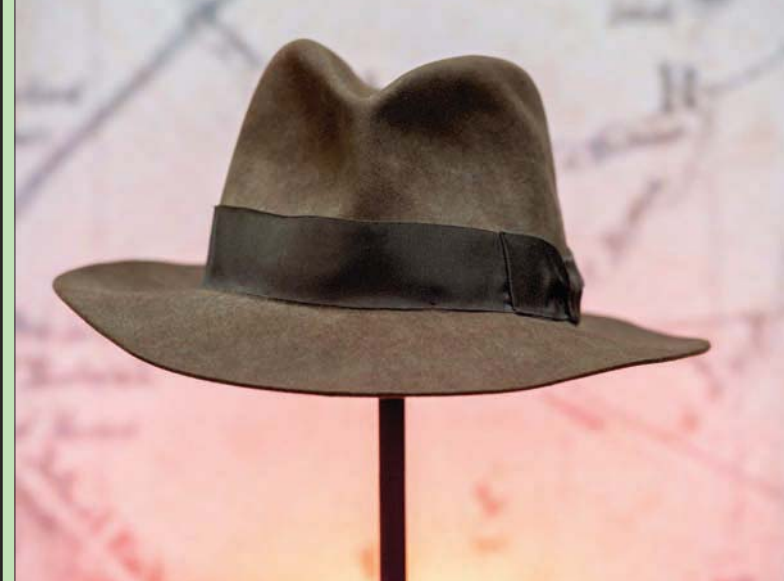
القبعة المميزة لشخصية إنديانا جونز السينمائية

استخدمها دنيايل رادكليف في الفيلمين الأخيرين من سلسلة «هاري بوتر»، والتي تبرعت بها استديوهات «وورنر براندز» وسيعود ريعها لأعمال خيرية. ولاحظ البنغر أن القطع المستخدمة في الأفلام أصبحت مطلوبة أكثر فأكثر وتزداد قيمتها بالنسبة لهواة الجمع. وأشار إلى أن «قطعاً كخوذات (ستورم تروبير) التي بيعت في الماضي، ارتفعت أسعارها في المزادات الأخيرة، إذ بات المزيد من الهواة يدركون أن في إمكانهم جمع أزياء سلسلة أفلام «ستار وورز». وبيع في العام الماضي في مزاد 287500 دولار زي لسارث فيجرر استخدمه للترويج لفيلم جورج لوكاس الشهير. ومن القطع المعروضة أيضاً عربة العولف التي يقودها براد بيت في فيلم «وانس أبان إيه تايم... إن هوليوود» والعصا السحرية والنظارات التي