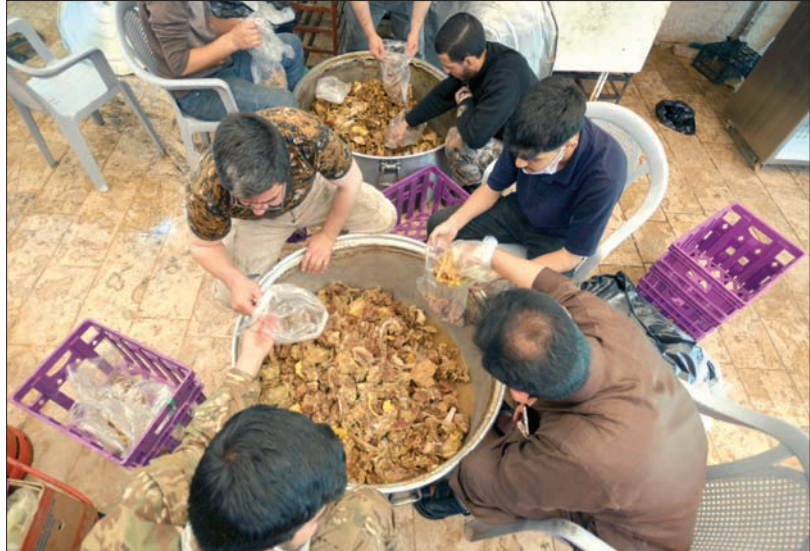
متطوعون يعدون طعاماً لتوزيعه على المحتاجين خلال شهر رمضان المبارك في معان بالأردن