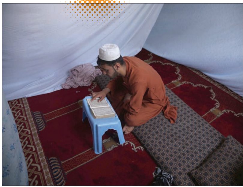
أنغاني يقرأ القرآن الكريم داخل مسجد في جلال آباد بأفغانستان خلال شهر رمضان المبارك