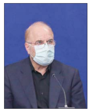
رئيس البرلمان محمد باقر قاليباف ورئيس القضاء إبراهيم رئيسي ونائب الرئيس إسحاق جهانغيري من بين المرشحين المحتملين للانتخابات الرئاسية الإيرانية

وأعلن النائب الإصلاحي السابق، محمود صادقي، أمس ترشحه للانتخابات الرئاسية، ذلك بعد نحو عام من رفض طلبه للترشح في الانتخابات البرلمانية، من قبل مجلس صيانة الدستور الذي ينظر في طلبات الترشح.