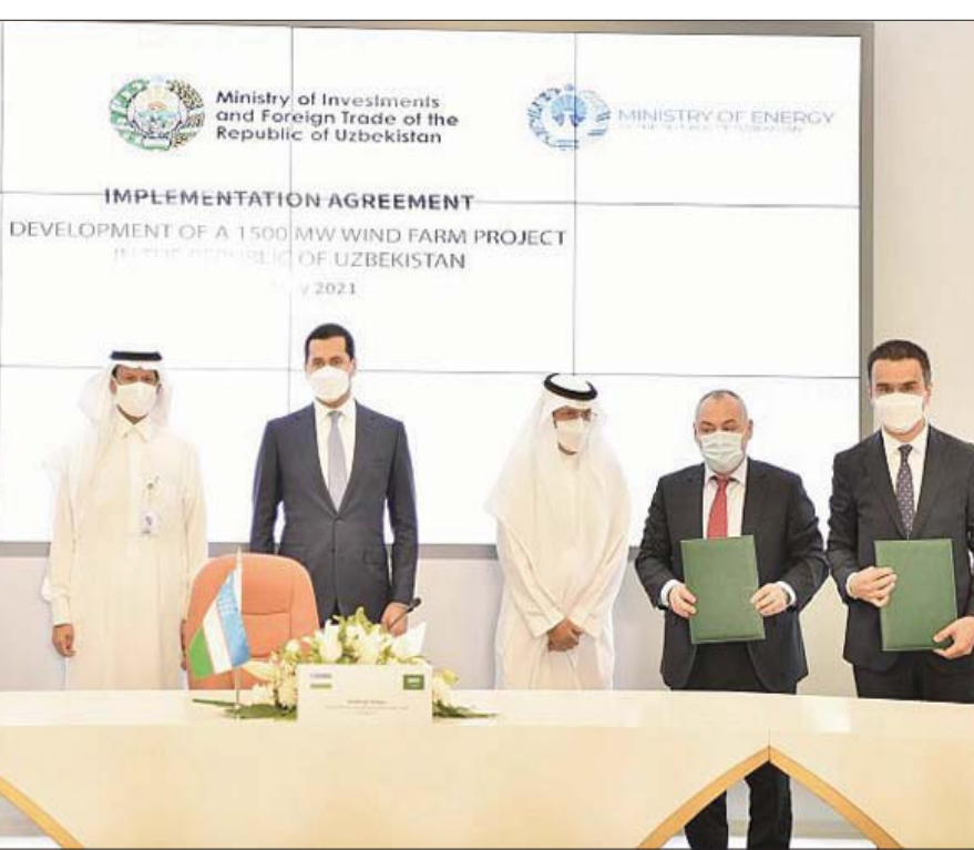
الأمير عبد العزيز بن سلمان وسردار عمر زاكوف ومحمد أبو نينان وبيزدي الحميد خلال توقيع الاتفاقية

ومن المتوقع أن يلبى المشروع احتياجات الطاقة لما يقرب من 4 ملايين وحدة سكنية، وخفض نحو 2,5 مليون طن من انبعاثات ثاني أكسيد الكربون سنوياً، ليسهم بشكل مباشر في أهداف الحكومة الرامية إلى توليد 30 في المائة من احتياجات الطاقة في أوزبكستان من مصادر متجددة بحلول العام 2030. إلى جانب مواكبة النمو المتزايد للطلب السنوي على الكهرباء بكفاءة وبشكل مستدام.