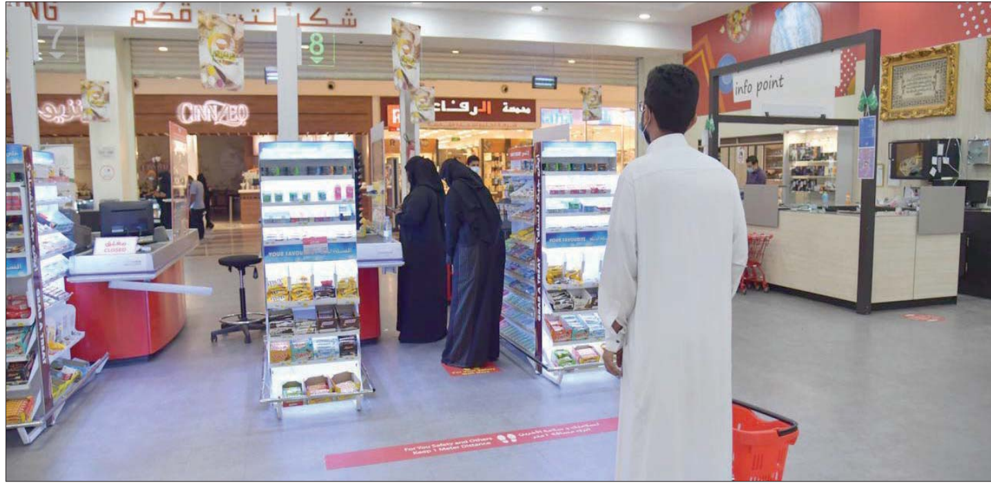
التزام الإجراءات الاحترازية في السعودية

وبيّنت الإحصائية أن إجمالي عدد الإصابات بلغ 421300 حالة وبلغ عدد حالات التعافي 404707 حالات، وفيما يخص الوفيات فقد تم تسجيل