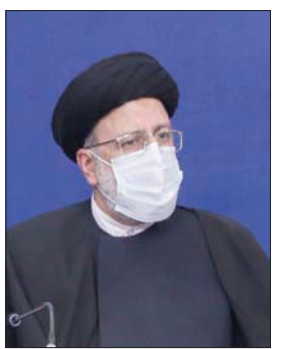
رئيس البرلمان محمد باقر قاليباف ورئيس القضاء إبراهيم رئيسي ونائب الرئيس إسحاق جهانغيري من بين المرشحين المحتملين للانتخابات الرئاسية الإيرانية