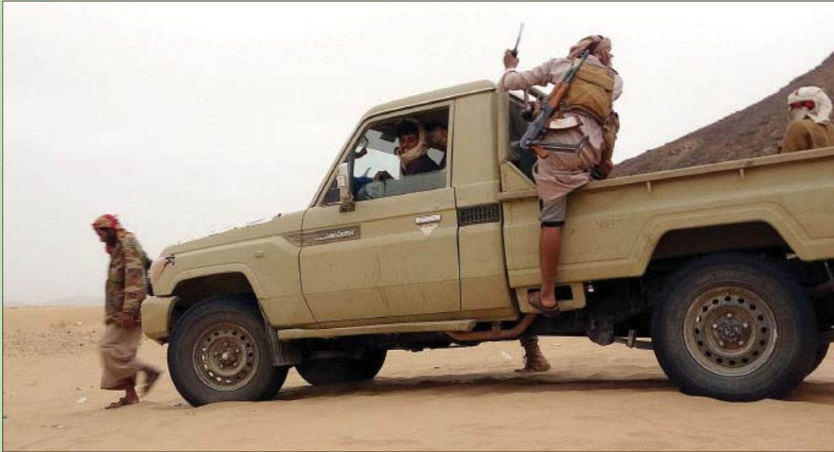
مقاتلون من الشرعية على جبهة مأرب الأسبوع الماضي

الإعلامي للقوات المسلحة اليمنية، فإن عناصر الجيش استدرجوا 30 حوثياً إلى كمين في جبهة المشج، قبل أن يطلقوا النيران ويوقعوا نهبهم 23 قتيلًا، فيما فرّ البقية بعد إصابتهم بجروح مختلفة، تأريخهم. وراءهم أسلحتهم وحثّ زملائهم. وأضاف المصدر أن مدفعية الجيش استهدفت تجمعات ومواقع الحوثيين في جبته المشج والكسارة، وكنتهم خسائر كبيرة في الأرواح والعتاد. كما طرأ إربان تحالف دعم الشرعية تعزيزات وتجمعات معادية في مواقع متفرقة غرب مأرب.