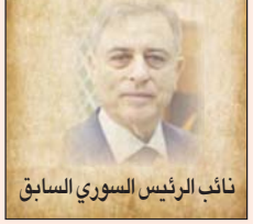
نائب الرئيس السوري السابق