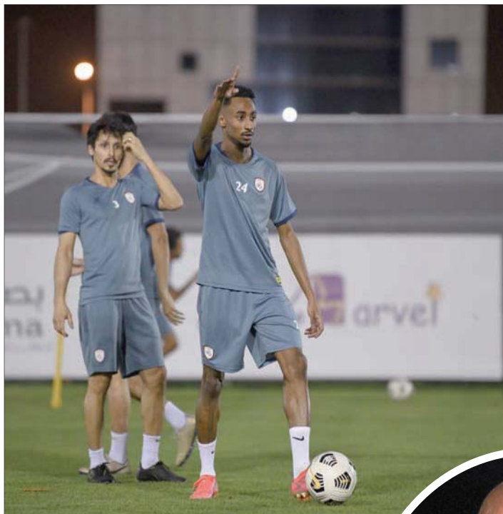
لاعبو الشباب خلال التدريبات أمس