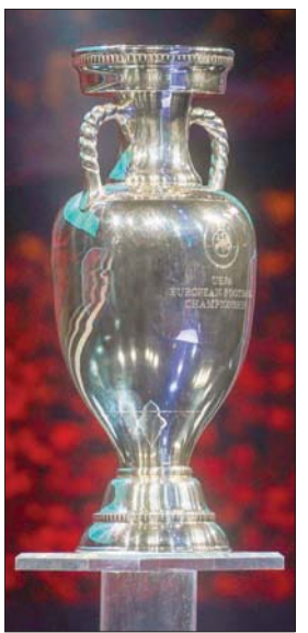
يويفا يسمح للمنتخب بضم 26 لاعباً في كأس أوروبا (أ.ف.ب)

مع جماهير تشيلسي، بعدما ضغط الحارس الدولي لتيمو كورتوا، مشاعر متناقضة حين تخلى تشيلسي الإنجليزي عن خدماته لصالح ريال مدريد الإسباني، إن كان من البائع بسبب تهمرد أحد أفضل حراس المرمى عليه، أو من الشاري الذي استقدم لاعباً غير مرغوب فيه حينها.