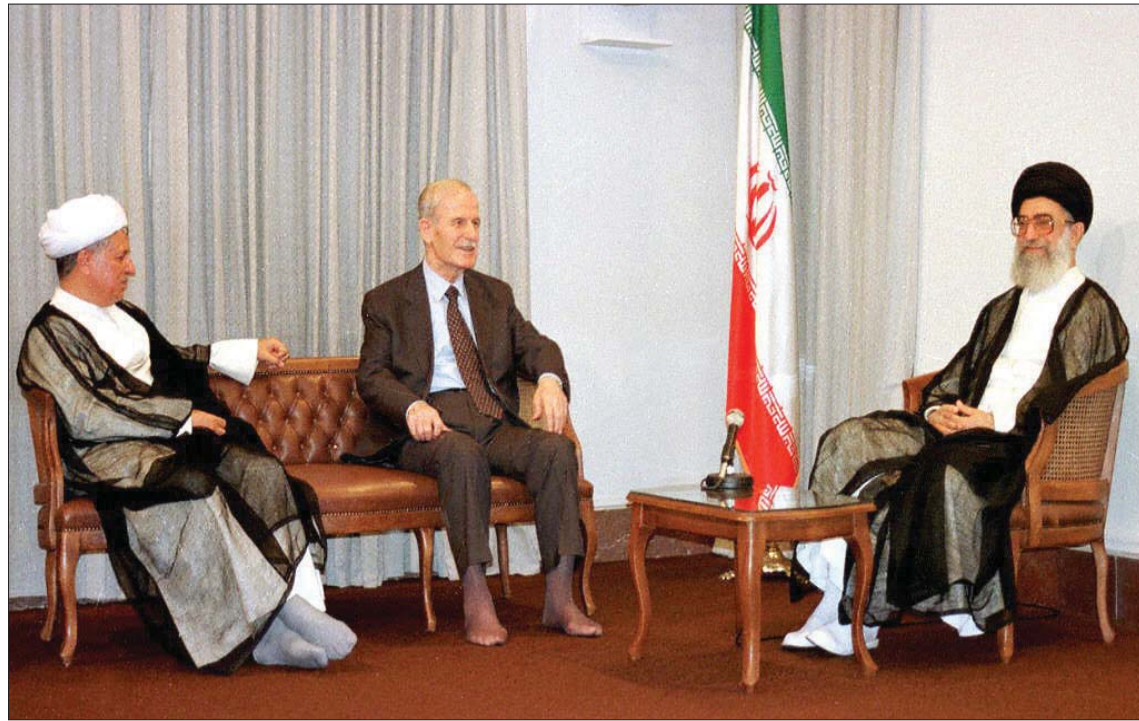
الرئيس الراحل حافظ الأسد والرئيس علي خامنئي في لقاءهما في دمشق عام 1982