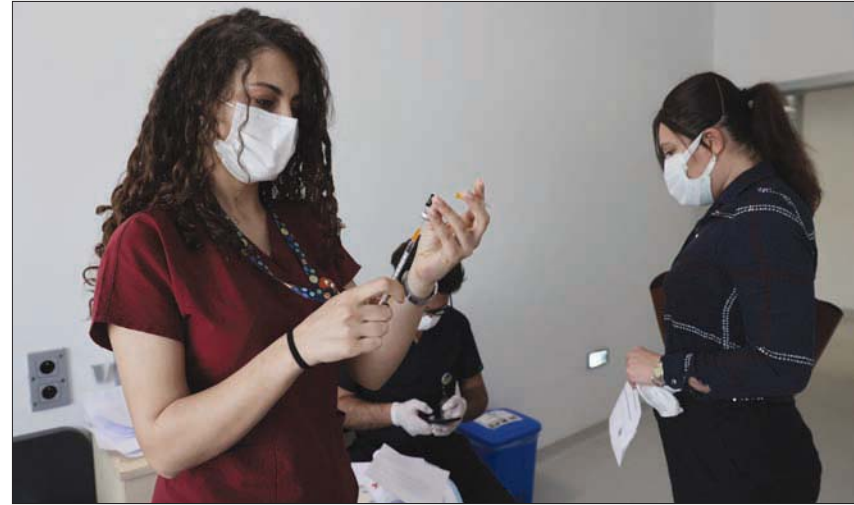
من حملة التطعيم في تركيا

أمستردام، «الشرق الأوسط» بدأت وكالة الأدوية الأوروبية في إجراءات مراجعة لقاح «سينوفاك» الصيني ضد فيروس «كورونا». وقالت الوكالة في أمستردام أمس (الثلاثاء)، إنه سوف يتم تقييم البيانات عبر الية المسار السريع بالوكالة. وأرجع خبراء الوكالة قرارهم إلى النتائج الأولية من الدراسات السريرية والمعملية، وفق وكالة الأنباء الألمانية. وقالوا إنه من الواضح أن اللقاح يحفز إنتاج أجسام مضادة ضد فيروس «كورونا»، ولذلك يمكن أن يكون فعالا في الحماية من الفيروس. وتدرس الوكالة البيانات وفقا لما يطلق عليها الية مراجعة التداول. وهذا يتضمن تقييم جميع البيانات، حتى قبل استكمال التجارب وقبل التقدم بطلب رسمي للحصول على ترخيص تسويق. وليس من الواضح الوقت الذي سوف تستغرقه عملية المراجعة. وقد تمت الموافقة على أربعة لقاحات في الاتحاد الأوروبي حتى الآن.