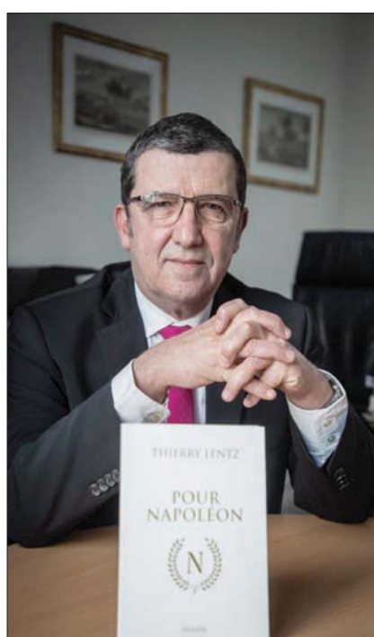
لوحة تصوّر الإمبراطور نابليون بونابرت في كامل هيئته الرسمية تعرض في قصر فونتينبلو قرب باريس

وشكلت أصول نابليون المتواضعة، وجراته المعطوفة على