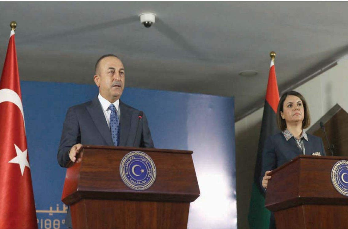
وزيرة الخارجية الليبية خلال مؤتمر صحفي مع نظيرها التركي في طرابلس أول من أمس

كما أشار أكار إلى أن تركيا قدمت إلى اليوم خدمات طبية إلى ليبيا، شملت أكثر من 10 آلاف معاملة وعلاج للمرضى الليبيين، إضافة إلى إبطال مفعول 4 آلاف و407 عبوات