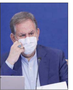
رئيس البرلمان محمد باقر قاليباف ورئيس القضاء إبراهيم رئيسي ونائب الرئيس إسحاق جهانغيري من بين المرشحين المحتملين للانتخابات الرئاسية الإيرانية