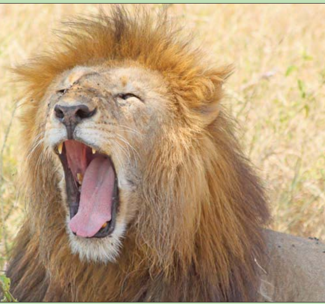
التثاؤب ينقل بعض الإشارات