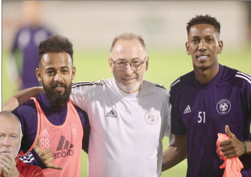
الفيصلي يسعى لكسب اللقب، للابتعاد عن «الخطر»

ويحتل فريق الفيصلي الذي يقوده البرازيلي شاموسكا حالياً المركز الثاني عشر برصيد 33 نقطة ويتطلع للتحول بنتيجة إيجابية أمام فريق النصر من أجل تحسين مركزه والابتعاد بصورة أكبر عن دائرة خطر شبح الهبوط الذي بات يهدد فريقين بعد اقتراب فريق «العين» من الصعود لأول مرة في الموسم وذلك بعد تعادل فريقه عند النقطة العشرين.