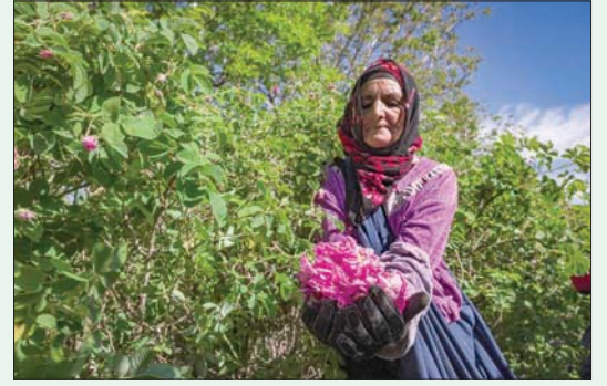
تريح بعض السيدات في قلعة مكونة بالمغرب نحو 6 دولارات عن 20 كيلوغراماً في اليوم خلال فترة ازدهار الورود التي تدوم قرابة شهر