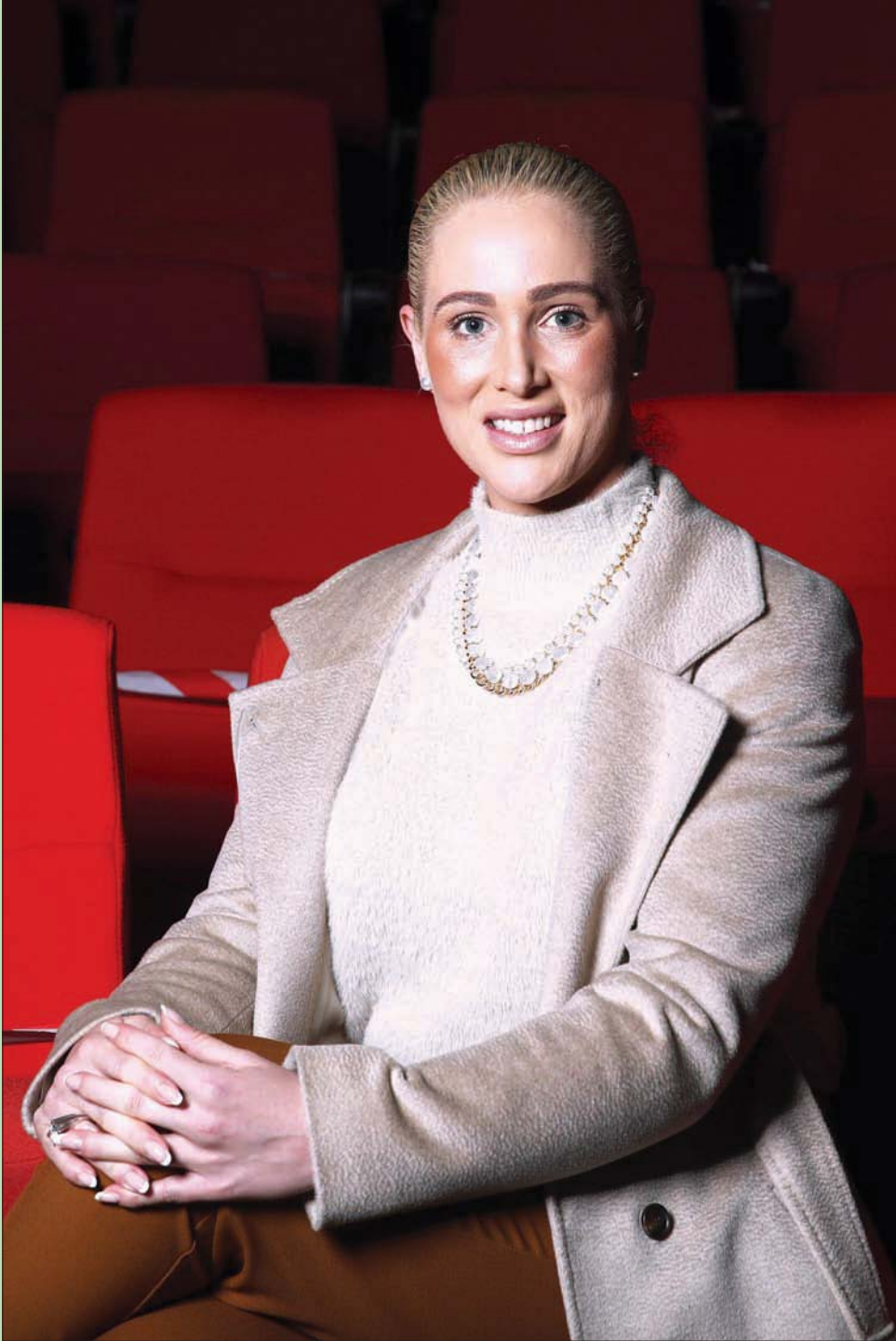
المثلة الأسترالية زوي تينك تحضر فيلم «ماليبو كراش» في سيدني أمس (غيتي)

العنصرية قبيحة، بكل أشكالها وتجب محاربتها بلا هوادة، هذا لا ريب فيه، لكن الفتنة والقتل... أعظم قبحاً منها وأجدر بالمحاربة... لو كانوا يعقلون أو ينصفون.