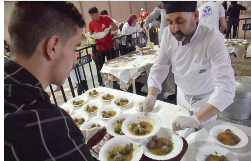
متطوعون جزائريون من جمعية «أمل الجزائر» يقدمون وجبات الإفطار للأسر الفقيرة

حقيقي. نحن نقدم أطباقاً حقيقية، والناس في الوقت الحاضر لا يستطيعون تحضير كسكس لذيق مع كل هذه المكونات الجيدة.