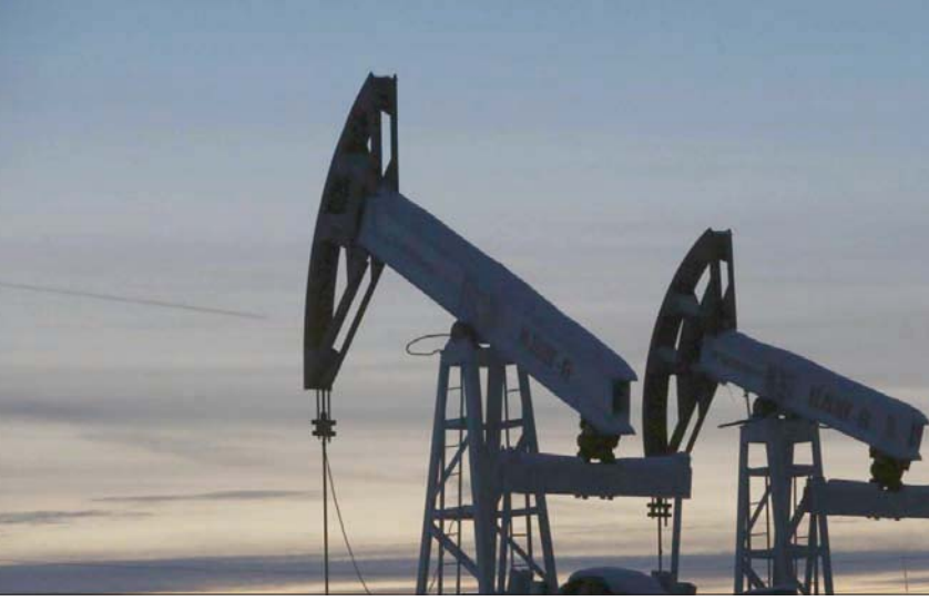
تقشي الفيروس في الهند ما زال يلقي بظلاله على الأسعار

ولأول مرة، حددت أدنوك سعر البيع الرسمي لخام مريان على أساس المتوسط الشهري لعقد مريان الأجل الذي أطلق حديثاً في بورصة ابوظبي إنتركونتيننتال للعقد الأجل، وأعلنت سعر البيع الرسمي لشهر يونيو قبل أرامكو السعودية. وعادة تعلن أسعار البيع الرسمية للخامات السعودية في الخامس من كل شهر تقريباً، وتحدد اتجاه أسعار خامات إيران والكويت والعراق، مما يؤثر على 12 مليون برميل يومياً تتجه إلى آسيا. وتحدد شركة النفط السعودية أرامكو السعر على أساس توصيات من العملاء وبعد حساب التغيير في قيمة نفطها على مدار الشهر المنصرم، من واقع أسعار المنتجات والعوائد.