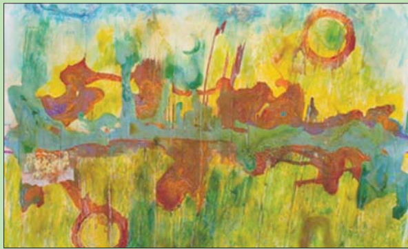
من أعمال فرانك بولينغ

التجريدية الأميركية. على الصعيد الشخصي، ولد بولينغ عام 1934 في غويانا، وكانت حينذاك مستعمرة بريطانية. وأجتاز بولينغ خلال مسيرته الفنية العديد من الأساليب الفنية، منها الشكل التعبيري وفن البوب والرسم الميداني بالألوان. واشتهر بولينغ بما عرف بـ«لوحات الخرائط»، التي تذيب صوراً بانورامية ملونة من زمانة بخرائط باهتة لغويانا وأفريقيا وأميركا الجنوبية. واشتهر بولينغ كذلك بشلالته القوية من الأصباغ، التي عرفت باسم «اللوحات المصبوبة»، وتقوم على صبغها من الطابع بأشياء من حياتنا اليومية، من المجلات، وأدب الأطفال، والصور الفوتوغرافية، والصور الفوتوغرافية، والصور الفوتوغرافية، والصور الفوتوغرافية.