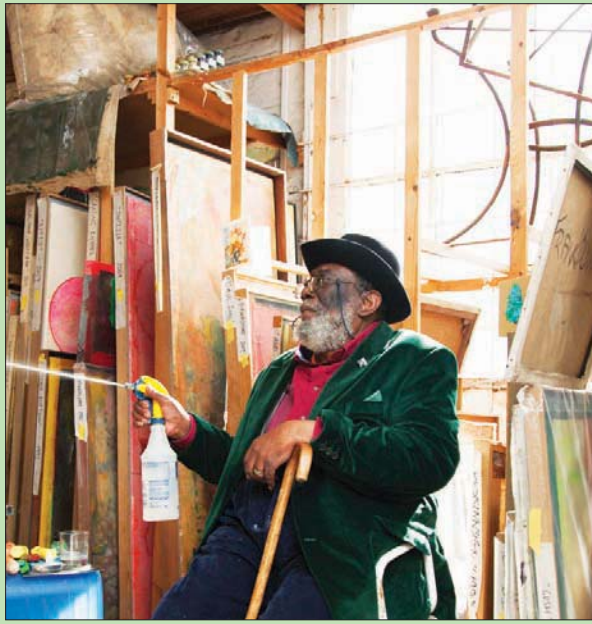
الفنان البريطاني فرانك بولينغ في عام 2017