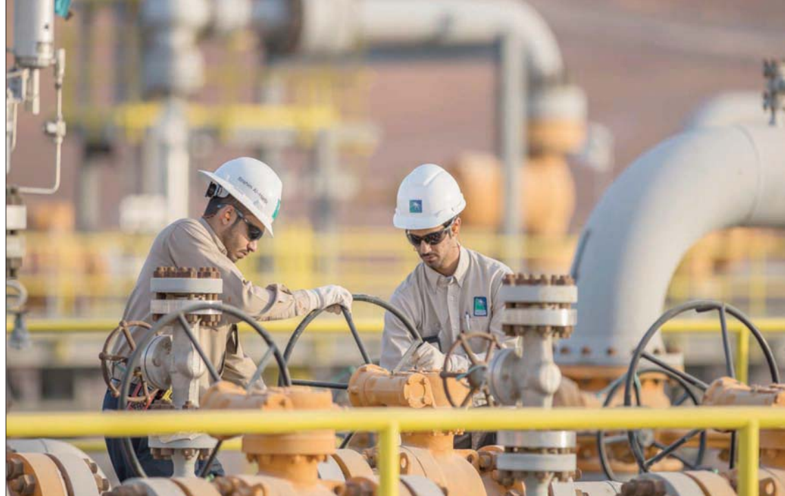
«أرامكو السعودية» تعلن عن انتعاش أرباحها للربع الأول مع تحسن أسعار النفط (الشرق الأوسط)

أفصحت فيه الشركة، أمس، عن «توزيعات أرباح بقيمة 18,8 مليار دولار» ستدفعها خلال الربع الثاني من هذا العام. وكانت «أرامكو السعودية» قد أدرجت في سوق الأسهم السعودية في ديسمبر (كانون الأول) عام 2019، بعد أكبر عملية طرح عام أولي في العالم، وصلت قيمته إلى 29,4 مليار دولار، مقابل بيع 1,7 في