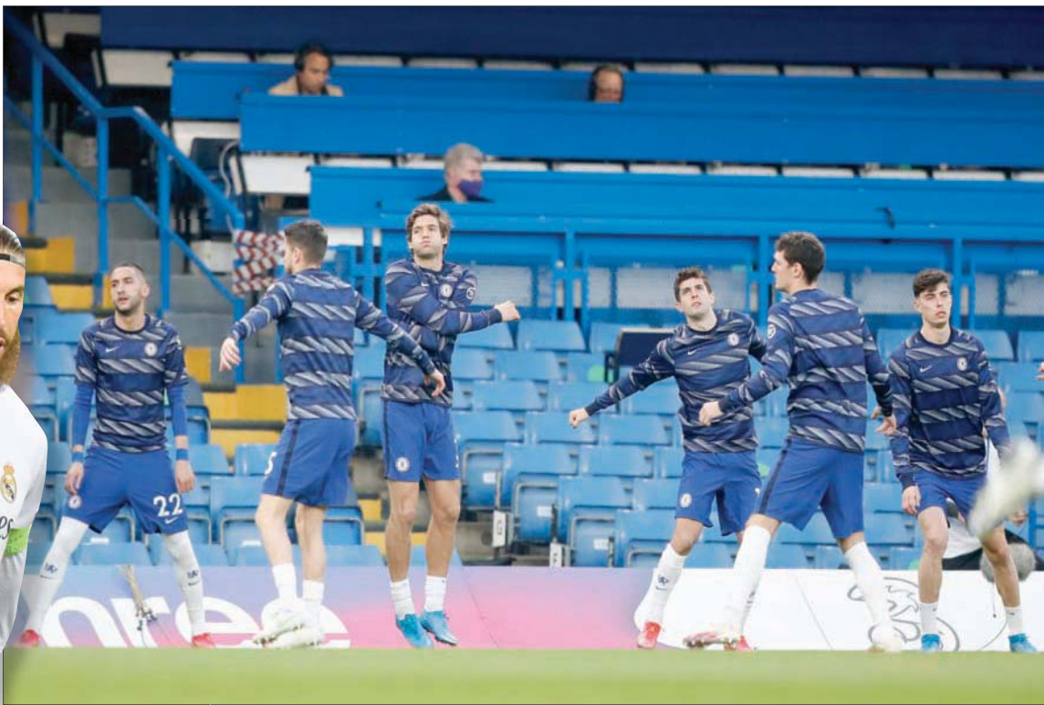
لاعبو تشيلسي يخوضون التدريبات بثقة كبيرة في قدرتهم على الانتصار على الريال اليوم (رويترز)

في المقابل، ومنذ وصول توخيل على رأس الجهاز الفني لتشيلسي، تغير وجه الفريق، مما جعله مرشحاً أيضاً للوصول إلى أول نهائي منذ فوزه باللقب في عام 2012. وحقق توخيل، المقال من تدريب باريس سان جيرمان الفرنسي، سلسلة جيدة مع فريقه الجديد خلفاً لنجم الفريق السابق فرنك لامبارد. وبعدما أراح العديد من الشباب كاي هافترس في خط الهجوم بعد ثنائيته في رمي فولهام، عندما جرى تحويل رأس الحربة الألماني الآخر