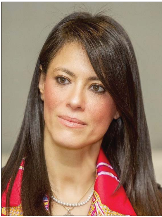
الدكتورة رانيا المشاط وزيرة التعاون الدولي المصرية

لقطاع النقل والمواصلات بما يخدم الهدف الاستراتيجي الخامس من أهداف برنامج الحكومة الخاص بتحسين معيشة المواطن؛ وتعزيز كفاءة واستدامة وسائل النقل من خلال تمويل تطوير خطوط مترو الأنفاق، وتمويل تنفيذ شبكة الطرق، وغيرها. نسعى لدفع حدود التعاون مع شركاء التنمية متعددي الأطراف، والصناعي والحكومات، وصانعي السياسات الاقتصادية الدوليين، والقطاع الخاص والمجتمع