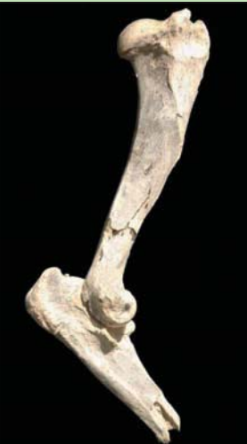
عظم العنق الذي قاد لاكتشاف القط الأضخم للقط (الفريق البحثي)

القاهرة، حازم بدر توصل باحثون أميركيون إلى نوع جديد من القط العملاقة ذات الأسنان السيفية، وقالوا إنها أضخم القطط في تاريخ الأرض، والتي عاشت في أميركا الشمالية ما بين 5 و9 ملايين سنة. وخلال الدراسة التي نشرت أول من أمس في دورية «تطور الثدييات»، أكمل الباحثون مقارنة ضمنية لسبع عينات أحفورية غير مصنفة مع حفريات تم تحديدها مسبقاً وعينات عظمية من جميع أنحاء العالم، واستطاعوا من خلال جزء الكوع من عظم العنق الذي تم العثور عليه في شمال وسط ولاية أوريغون، تحديد هوية نوع جديد من القطط هو الأضخم في التاريخ، وقدروا وزنه بـ900 رطل (حوالي 400 كيلوغرام)، وكان يمكنه صيد حيوانات بحجم الثيران. وكان جون أوركوت، الأستاذ المساعد في علم الأحياء بجامعة غونزاغا، قد نشر على عينة كبيرة من عظام الأضخم العنقوي وتم تصنيفها في مجموعة متحفة التاريخ الطبيعي والثقافي بجامعة أوريغون على أنه قط، وتعاون مع جوناثان كالدي، الأستاذ المساعد للمنظور والبيئة وعلم الأحياء العضوية بجامعة ولاية أوهايو، في الجهود التي استمرت لسنوات لمعرفة أي نوع يمكن أن يكون القط. وزار الأثنان العديد من المتاحف في الولايات المتحدة