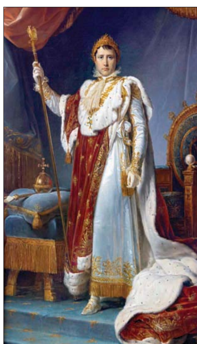
لوحة تصوّر الإمبراطور نابليون بونابرت في كامل هيئته الرسمية تعرض في قصر فونتينبلو قرب باريس

واستهو هذا المحاضر في جامعة السوربون كتابان صدرا