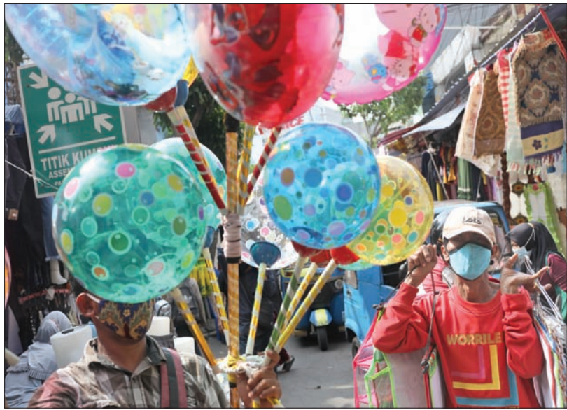
باعة داخل سوق في جاكرتا بإندونيسيا خلال الأسبوع الأخير من شهر رمضان المبارك