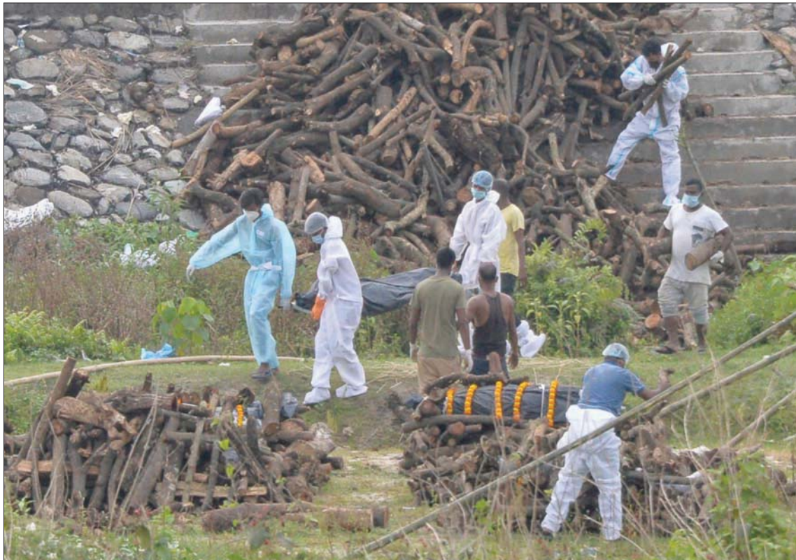
عمال يجهزون جثث ضحايا «كورونا» لحرقها في الهند

أبريل (نيسان)، فقد أعلنت الإثنى أيضا أنها أوقفت استخدام لقاح جونسون أند جونسون بسبب آثار جانبية خطيرة رغم موافقة الهيئة الناظمة الأوروبية عليه ومنظمة الصحة العالمية. كما أعلنت الدنمارك الثلاثاء عن مراحل جديدة لإعادة فتح البلاد بفضل السيطرة على الوضع الوبائي وصدور الجواز الصحي الذي كانت أحد رواده في أوروبا. في الولايات المتحدة، الدولة الأكثر تضررا في العالم من حيث عدد الوفيات، أعلنت فلوريدا الاثنين رفع كل قيود (كوفيد - 19) المعمول بها، مشيرا إلى فاعلية اللقاحات وتوافرها في الولاية. وتلقى نحو تسعة ملايين شخص في فلوريدا التي يبلغ عدد سكانها 23 مليون نسمة جرعة لقاح واحدة على الأقل. كذلك، أعلن حاكم ولاية نيويورك التي كانت سابقا بؤرة الفيروس في الولايات المتحدة، أندرو كومو الاثنين رفع العديد من القيود التي فرضت للحد من انتشار فيروس «كورونا»، بما في ذلك استئناف عمل المترو في المدينة على مدار 24 ساعة. وقال كومو إنه اعتبارا من 19 مايو سيتم إلغاء نسب الإغلاق المحددة في العديد من المنشآت التجارية والثقافية في المدينة، بما في ذلك المتاجر والمطاعم ودور السينما والمتاحف.