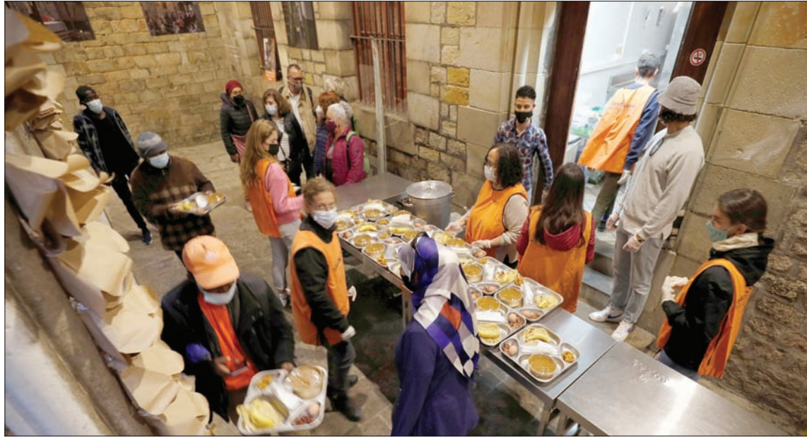
فطور رمضان في كنيسة برشلونة

شعلات المواعد التي تعمل بالفانز. وقال سانتشيت «رغم اختلاف الثقافات واللغات والأديان، أصبحنا أكثر قدرة على الجلوس والحديث أكثر من بعض الساسة».