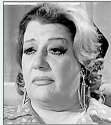
الفنانة ميمي شكيب