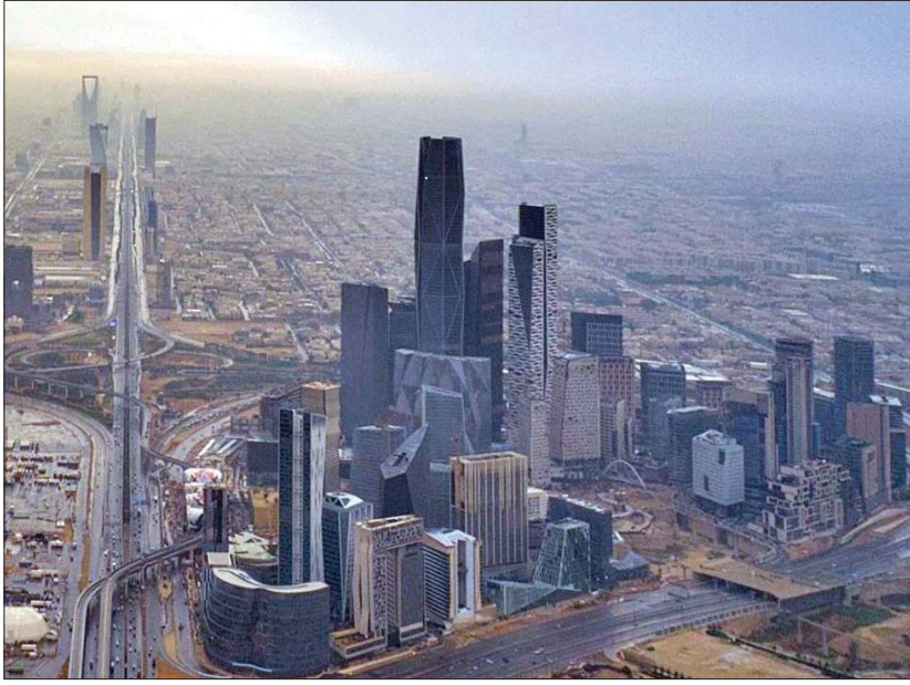
ميزانية السعودية تسجل نمواً بإجمالي الإيرادات وارتفاع العوائد غير النفطية خلال الربع الأول من العام (الشرق الأوسط)

وقال صندوق النقد الدولي إن العجز المالي السعودي سينخفض إلى 4,2 في المائة من الناتج المحلي الإجمالي هذا العام، وهو أقل قليلاً من المتوقع في الميزانية. وكانت وزارة المالية السعودية رحبت بالبيان الختامي الصادر عن بعثة خبراء صندوق النقد الدولي، إثر اختتام مشاورات المادة الرابعة الافتراضية مع السعودية لعام 2021، التي جرت خلال أبريل (نيسان) الماضي، حيث أفاد البيان بأن الإصلاحات الاقتصادية في المملكة حققت نتائج إيجابية، متوقعاً استمرار تعافي الاقتصاد مع تراجع معدل البطالة وتباطؤ تضخم مؤشر أسعار المستهلكين. وأشار البيان الدولي إلى نجاح حكومة المملكة في الحد من حالات الإصابة والوفيات الناجمة عن جائحة «كورونا»، بفضل