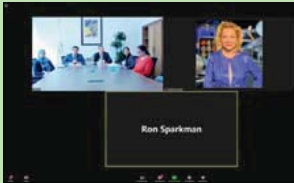
جانب من الاجتماع بين الجانبين

الاتصالات، وإدارة الكوارث، وتحسين التعليم، وحماية البيئة، وتطوير الزراعة، وإدارة الموارد الطبيعية، فضلاً عن دور تكنولوجيا الفضاء في تطوير برامج العلوم، والتكنولوجيا، والهندسة، والرياضيات، وبناء القدرات، وتنمية مهارات الأفراد. وفي ختام الاجتماع، اتفق الجانبان على التنسيق لتطوير التعاون بين «إيسيسكو» ومؤسسة الفضاء الأميركية.