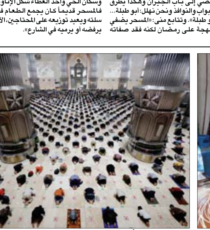
مصلون يحافظون على التبايع الاجتماعي في صلاة الجمعة بمسجد الاستقلال الكبير في جاكارتا خلال الشهر الفضيل