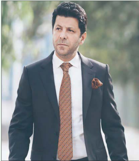
الفنان الأردني أياد نصار

جدا ما يريده ولديه مشروع ومينج ممين». وعُد نصار مشاركته في النسخة العربية من الفيلم الإيطالي «Perfect Strangers» تجربة مهمة في مشواره الفني: «لا أستطيع أن أقول إنها خطوة عرضة ومقارنته بالنسخ الأجنبية، وكل ما أتمناه هو أن تحقق النسخة المصرية نجاحا مثلما حققت النسخ الأجنبية». مشيراً إلى «أنه يوجد عدد كبير من الفنانين المصريين والبنانيين مشاركين في تلك النسخة، من بينهم الفنانة المصرية منى زكي، وعادل كرم، وجورج خيبر، ومن إخراج نادين لكي».