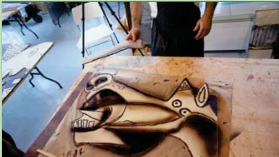
نسخة من لوحة «جيرنيكا» بالشوكولاته

حجم اللوحة التي يبلغ ارتفاعها نحو 3,5 متر وعرضها ثمانية أمتار. وللتخليل على ذلك قام صانعو الشوكولاته بإعداد 14 لوح شوكولاته منفصلاً. وسيتم عرض لوحة الشوكولاته في عدة أماكن من بينها مدينة جيرنيكا.