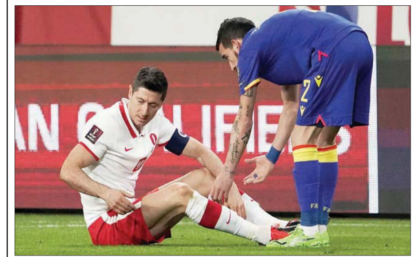
ليفاندوفسكي يعود لصفوف بايرن بعد شفائه من الإصابة مع منتخب بولندا

مركز الرابع، مع باير ليفركوزن، صاحب المركز السادس. وتغلب بايرن ميونيخ على ليفركوزن 2 / صفر، الثلاثاء، ولم تظهر أي بوادر للفوضى في أعقاب إعلان هانسي فليك، مدرب بايرن، عن رغيبته في الرحيل بنهاية الموسم الحالي. وقال ليون غوريتسكا: «ما يجعلنا نتحرك هو أننا نريد الفوز بكل مباراة»، وأضاف غوشوا كيميشت: «نريد الفوز باللقب ونحن قريبون للغاية. هذا هو طموحنا». وقال فليك ببساطة: «نريد أن ننهى الأمر يوم السبت».