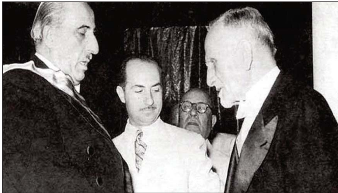
انتقال السلطة بين الرئيسين هاشم الأتاسي (يمين) وشكري القوتلي في عام 1955

تموز) أصبح أمين المحافظ (كانون الأول) 1949، انقلابه حين قيام صلاح جديد بـ «حركة» ووضع الحناوي بالسجن لمدة فبراير (شباط) في 1966، وتسلم نور الدين الأتاسي منصب «رئيس الدولة». بعد قيام وزير الدفاع حافظ الأسد بـ «الحركة التصحيحية» في 16 نوفمبر (تشرين الثاني) 1970، عين أحمد الخطيب (رئيس دولة) إلى مارس