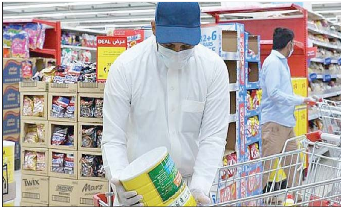
انتعاش الطلب على الأغذية خلال شهر رمضان يعزز تعافي قطاع التجزئة السعودي (الشرق الأوسط)

ويشمل قطاع التجزئة أكثر من 420 نشاطاً إلا أن الأظعمة والمشروبات، والمركبات وما يدخل