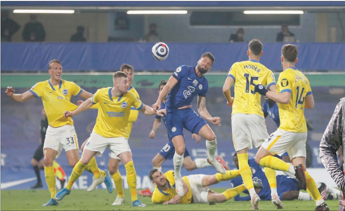
جيرو فوشل كما فشل زملاؤه في تشيلسي في هز شبك برايتون في الجولة الماضية

ستصعب في مصطلحه مهما كانت النتيجة، يامل ليفربول الإفادة من نهاية الأسبوع قبل المباراة التي تنتظره أمام مضيفه غريمه التقليدي مانشستر يونايتد على ملعب «أولد ترافورد» الأسبوع المقبل، علماً بأن الأخير يحل على ليدز يونايتد الأحد ساعياً وراء فوز سادس على التوالي في الدوري قبل استضافته روما الإيطالي في ذهاب الدور نصف النهائي من الدوري الأوروبي «يوروبا ليغ» الخميس المقبل. هذا ليستر سيتي من مخاوف جماهيره بعودته الخميس إلى سكة الانتصارات بعد هزيمتين متتاليتين في الدوري، باكتساحه مضيفه وست بروميتش بثلاثة نظيفة ليتبعه بفارق أربع نقاط عن تشيلسي وستهام. وكان فريق ليستر خسر معركة الشاهل إلى المباراة القارية الأخرى من الموسم الماضي. وبعد هزيمتين أمام مانشستر سيتي وستهام هذا الشهر وضعت في خطر، استعداد رباطه جاشه أمام وست بروميتش قبل استضافته كريستال بالاس الاثنين.