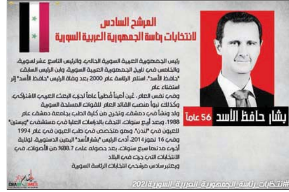
بطاقة ترشح الرئيس بشار الأسد إلى انتخابات الرئاسة

تموز) أصبح أمين المحافظ (كانون الأول) 1949، انقلابه حين قيام صلاح جديد بـ «حركة» ووضع الحناوي بالسجن لمدة فبراير (شباط) في 1966، وتسلم نور الدين الأتاسي منصب «رئيس الدولة». بعد قيام وزير الدفاع حافظ الأسد بـ «الحركة التصحيحية» في 16 نوفمبر (تشرين الثاني) 1970، عين أحمد الخطيب (رئيس دولة) إلى مارس