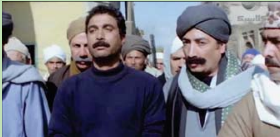
لقطة من فيلم «الهرب» بطولة الراحل أحمد زكي

فيما كان ثالث الملامح التي ميّزت محرم، خريج قسم الأدب الإنجليزي، مثلما ميّزت أبناء جيله، حسه الأدبي الرفيع، لأنهم تقريباً أدباء وأصدر معظمهم روايات ومسرحيات، وتابع صالح: «على حد علمي لم ينشر محرم أدباً، لكنّ هذا الملح يظهر في تنظيره للكتابة الدرامية، وترجمته لبعض الكتب مثل (تشریح الفيلم)، إضافة لكتابة سيرته الفنية. ويمكن القول إنه دخل إلى مجال السينما من باب القارئ الشغوف بالأدب، أكثر منه من باب صاحب المهوبة الأدبية».