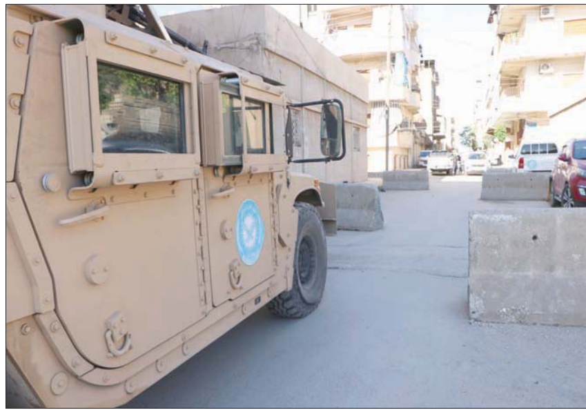
عربة أميركية تابعة للشرطة الكردية في القامشلي شمال شرقي سوريا أمس

سوى نقاط قليلة بيد الميليشيات، لولا تدخل الروس لكانت الحارة تحت سيطرة قواتنا». وقال قائد القيادة المركزية الأميركية الجنرال كينيث ماكنزي، إن «قوات سوريا الديمقراطية» (قسد) «شريك مهم جداً لنا وهي