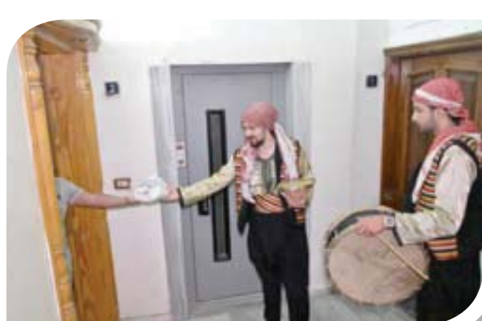
مسحراتي يوزع طعام السحور في دمشق

ومع ذلك يبقى لظهور المسحر في لبالي رمضان سحره الخاص، سيما وقد أعادت دراما البيئة الشامية إحياءه بحلته التراثية، بحسب رأي طالب جامعي يسكن في دمشق القديمة، ويؤكد أن صوت المسحر يشعر بالسلام وهو ينظر شهر رمضان ليستمتع برؤية مسحر حي القميرية (أبو الهيجا) وهو يتجول ليلاً في الأزقة المعتمة حاملاً طبلته ومزجياً اللباس الشعبي (حذاء كسرية عجمية وسروال وشالة حرير على الخصر وقميص صاية شامية وخنجر)، مردداً نداءاته وأدعيته الخاصة بالشهر الكريم.