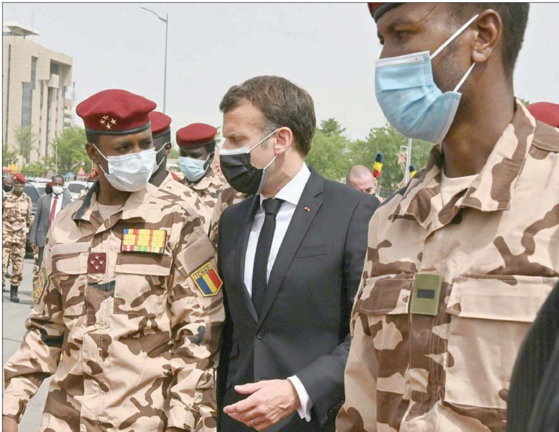
ماكرون وعلى يمينه ابن الرئيس الراحل الجنرال محمد إدريس ديبى (أ.ف.ب)

في كلمته التابينية أمس، شدد ماكرون على أن فرنسا «لن تدع أحداً، لا اليوم ولا غداً، يمس استقرار وسلامة أراضيها». وبذلك يكون ماكرون قد قدم «بوليصاً تامين» لرجل تشاد القوي الجديد فيما يخفف الكثيرون من أن يكون هذا البلد قادماً على مرحلة من اللقالق وانعدام الاستقرار. وما قاله ماكرون، إنهم وزير خارجي الاتحاد الأوروبي جوزيب بوريل،