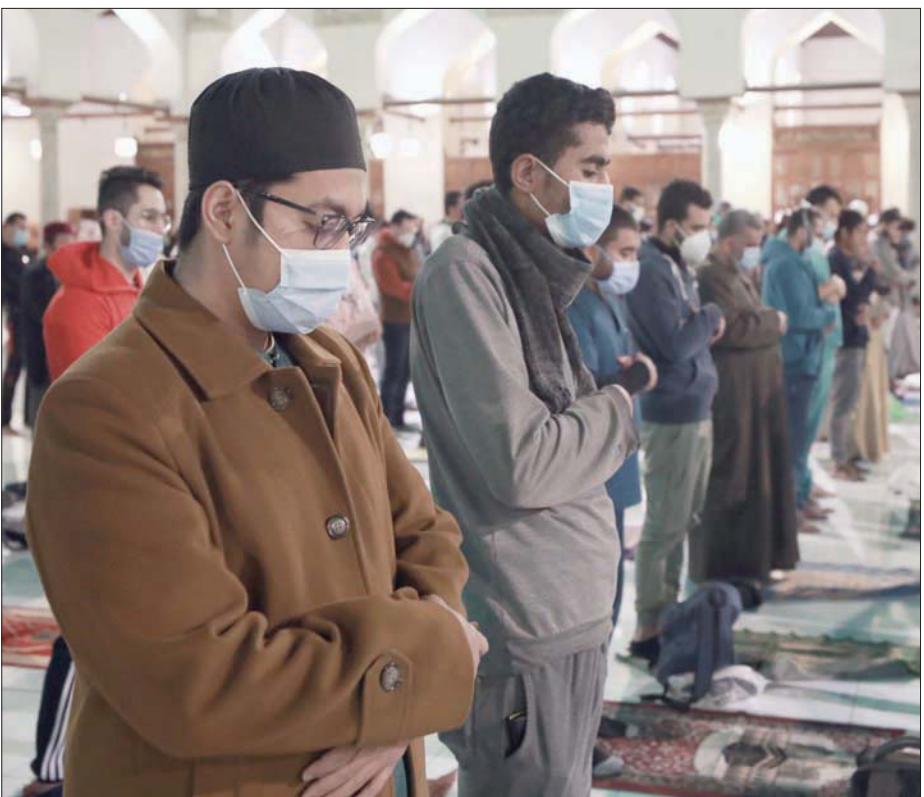
صلاة التراويح في مسجد الأزهر بالقاهرة (إ.ب.أ)

في التراويح بما لا يتجاوز نصف ساعة، وعدم السماح بإقامة أي موائد إفطار، وعدم السماح بالاعتكاف أو صلاة التهجيد بالمساجد، واصطحاب المصلين الشخصي، ومراعاة مسافات التباعد الاجتماعي، وفتح المساجد قبل الصلاة بعشر دقائق وغلقها بعد الصلاة بما في ذلك صلاة التراويح.