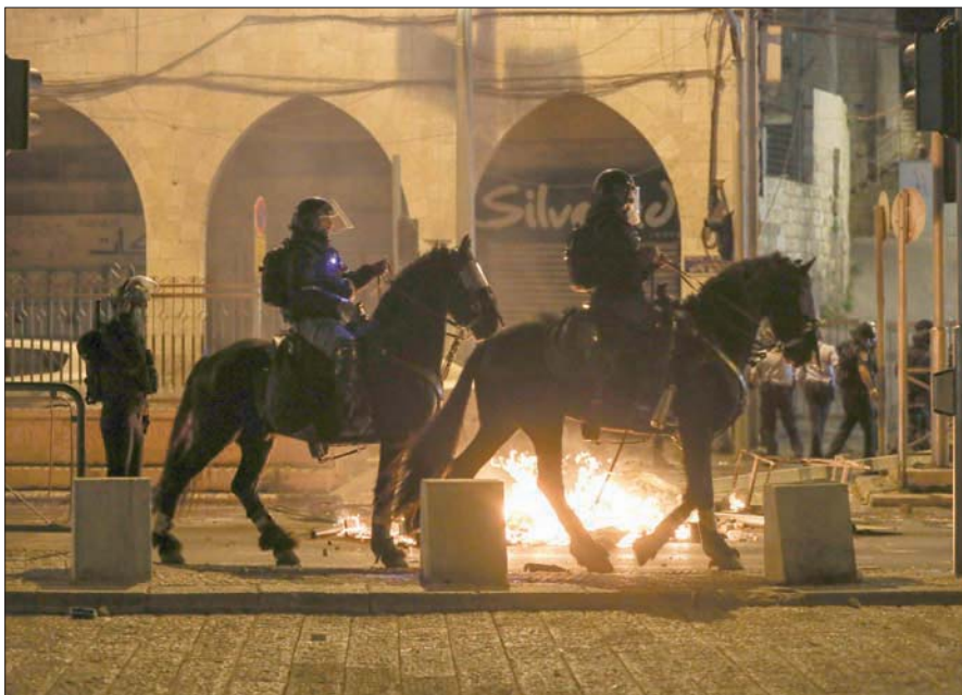
عنصران من الشرطة الإسرائيلية خلال مواجهات مع فلسطينيين في القدس أمس

مدينة القدس والمدن الفلسطينية الأخرى وفي الصباح وساعات الظهيرة شددت قوات الاحتلال الإسرائيلي إجراءاتها العسكرية في محيط الأقصى واستقرت المصلين وعزلت وتدابير أمن واستقرار المنطقة برمتها، داعيا المجتمع الدولي للاضطلاع بدوره ووقف هذه الاعتداءات وعدم الصمت حيال تلك الانتهاكات وضرورة توفير الحماية الدولية للشعب الفلسطيني، خاصة المقدسين الذين يتعرضون لأبشع عملية طرد وتهجير قسرية من مدينتهم.