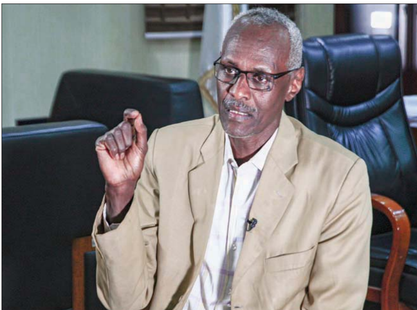
وزير الري السوداني ياسر عباس

ويعاد الإطلاع على التقرير النهائي الصادر عن المجلس الإيراني للتحقيق في حوادث الطائرات، وخلص مبلينه إلى وجود دلائل تؤكد أن الحرس الثوري الإيراني قد تمهد نشر تقانات التشويش بالحرب الإلكترونية بالتنسيق المباشر مع وحدة «تور إم 1» للدفاع الجوي الإيراني والمسؤولة عن إطلاق الصاروخين اللذين تسببا في إسقاط طائرة الركاب المدنية الأوكرانية.