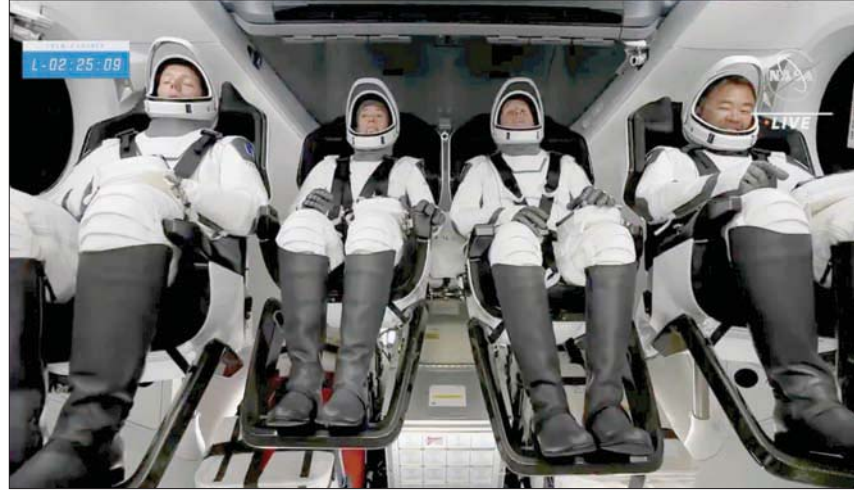
رواد الفضاء ينتظرون الإقلاع داخل سفينة الفضاء «دراغون»

وهناك أيضاً هدف مهم آخر للرحلة يتمثل في توليد الطاقة الشمسية للمحطة عن طريق تركيب ألواح مدمجة جديدة تتدرج مثل سجادة يوغا ضخمة.