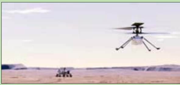
واشنطن - لندن: «الشرق الأوسط»

المرة الأولى، محققة بذلك اثنين من طموحات «ناسا». وأوضح «إنجينويتي» المصغرة التابعة لوكالة الفضاء الأميركية (ناسا)، أول من أمس، في تنفيذ طلعة ثانية في أجواء المريخ، انطوت على مخاطرة أكبر من الطلعة الأولى التي جرت الإثنين، وأصبحت بنتيجتها أول مركبة مزودة بمحرك تحلق فوق كوكب آخر.