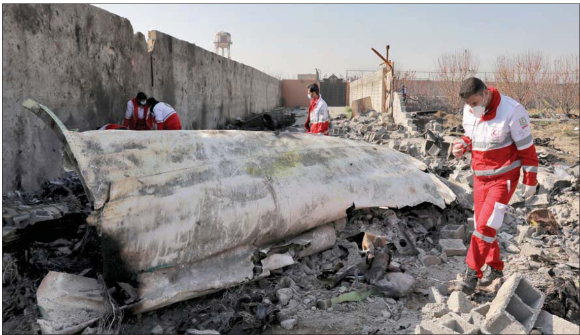
تلندن، «الشرق الأوسط»

ظهرت أدلة دامغة جديدة تشير إلى أن حادثة إسقاط رحلة الخطوط الجوية الدولية الأوكرانية 752 من قبل قوات الحرس الثوري الإيراني، لم تكن على سبيل الخطأ بل حال من الأحوال، وإنما عمل متعمد مقصود. وخلص محققو السلامة من هيئة الطيران المدني الإيرانية إلى أن طائرة الركاب المنكوبة من طراز «بوينغ 737 - 800» قد أسقطت عن طريق الخطأ في يناير (كانون الثاني) 2020، بعد وقوع خطأ في التحديد من قبل إحدى وحدات الدفاع الجوي الإيرانية التي اعتبرت الطائرة المدنية هدفاً معادياً وتعاملت معها على هذا الأساس. ولقد لقي كل ركاب الطائرة رفقة أفراد الطاقم مصرعهم والذين بلغ عددهم 176 ركاباً في الحادثة.