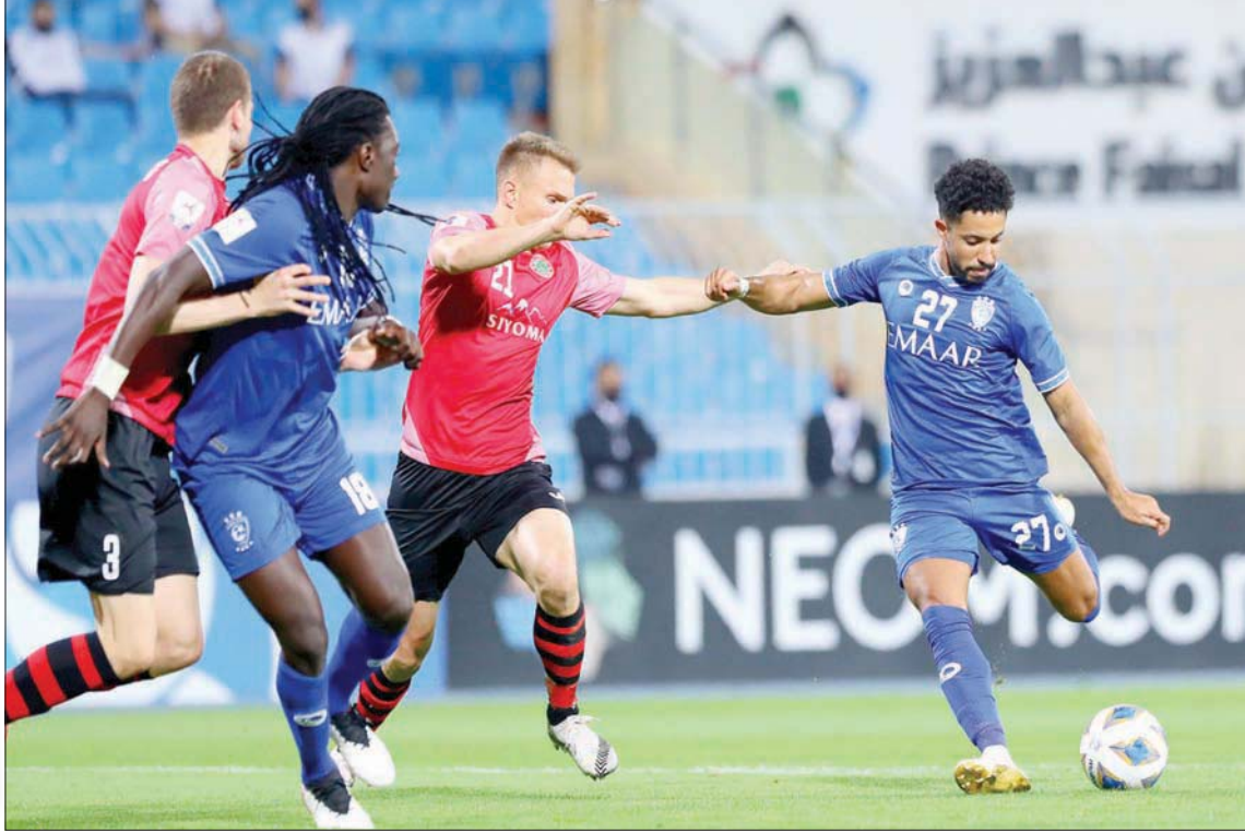
الأهلي كسب الشرطة العراقي بثلاثية في مواجهتهما الماضية

ورفع الأهلي بعد فوزه أمام الشرطة العراقي رصيده إلى أربع نقاط في المركز الثالث، فيما يتصدر الدحيل القطري المجموعة بسبع نقاط، ويحضر خلفه فريق