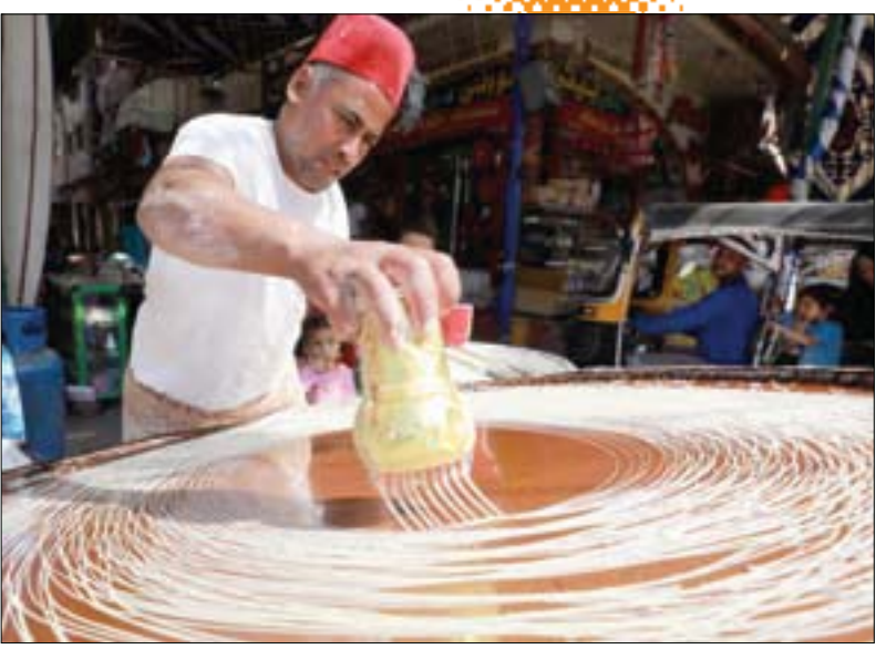
خباز مصري يحضر «كنافة» وهي حلوى شرق أوسطية تقليدية تُباع خلال رمضان في سوق بالقاهرة القديمة