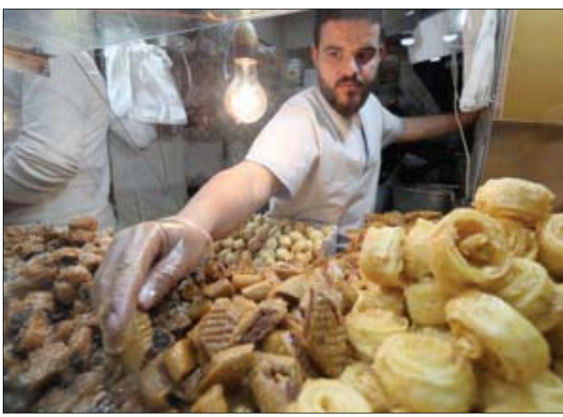
تونس يبيع الكعك التونسي التقليدي «مقروط» خلال رمضان في المدينة القديمة بتونس العاصمة