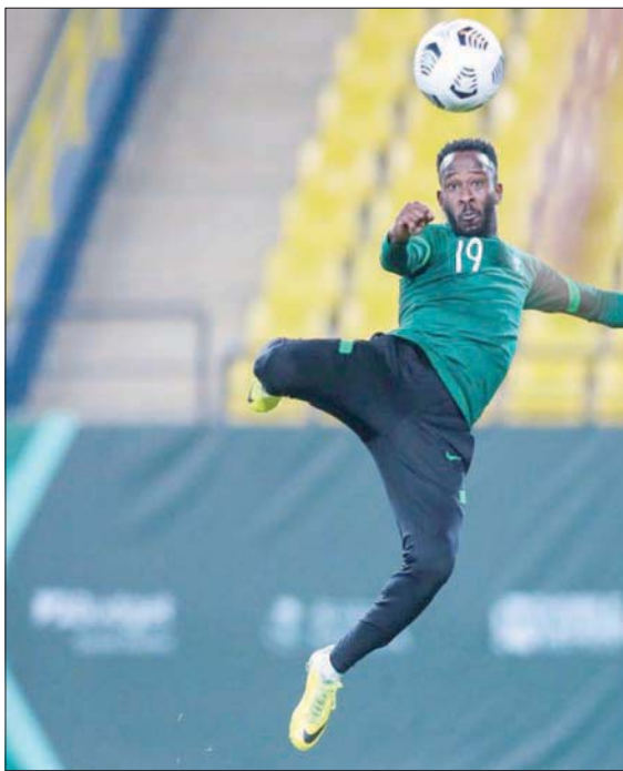
فهد المولد (الشرق الأوسط)

كما أن هناك تحركات جديدة من أجل خوض مباراة ودية ضد المنتخب الأرجنتيني بطل قارة أميركا الجنوبية الذي يشابه في أسلوبه المنتخب البرازيلي