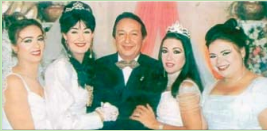
لقطة من مسلسل «عائلة الحاج متولي» بطولة نور الشريف