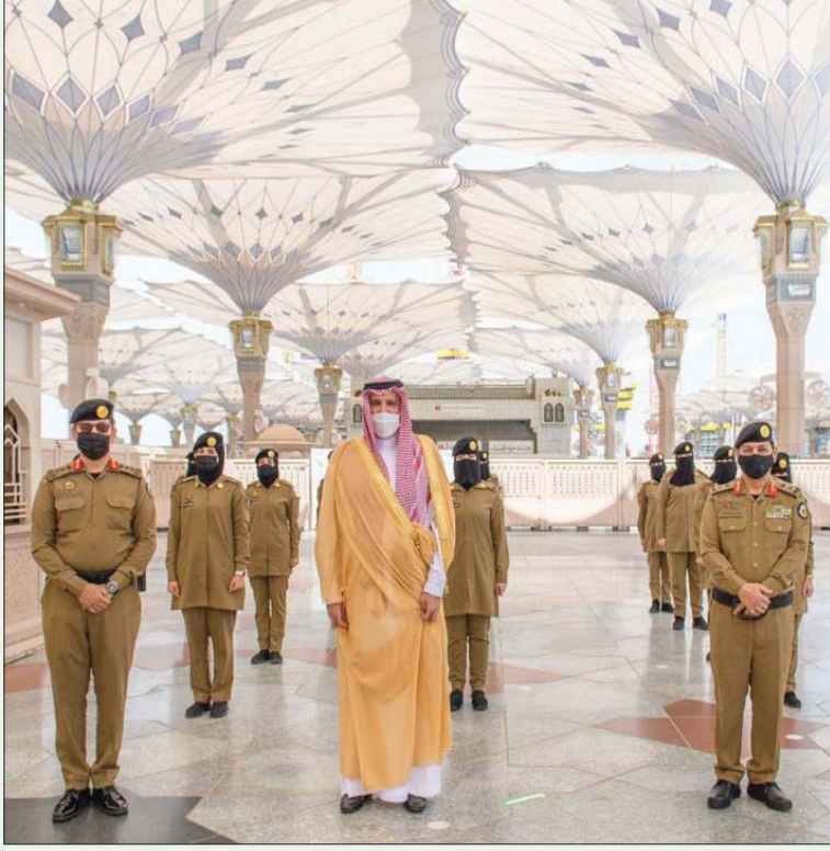
المدينة المنورة، «الشرق الأوسط»

بتشجيع العسكريين ومن بينهم عدد من العناصر النسائية ضمن القوة الخاصة لآمن المسجد النبوي الشريف، ما دفع كافة وسائل الإعلام، للحديث عن المرأة السعودية وإمكاناتها وقدراتها في القيام بالمهام المنوطة بها أداءها على أعلى درجة من الإلتقان.