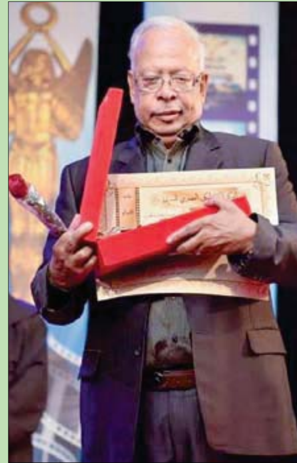
الكاتب الراحل مصطفى محرم

وقد رحل مصطفى محرم عن عمر يناهز 82 عاماً، بعد تعرضه لأزمة صحية مفاجئة، نُقل على إثرها إلى العناية المركزة بأحد المستشفيات الخاصة، وشُعت جنازته من مسجد «السيدة نفيسة» في وسط القاهرة أمس. من جانبها قالت وزيرة الثقافة المصرية إيناس عبد الدايم، في بيان تنعى فيه مصطفى محرم: «إن الفيلم قدم معالجات أيقونية لكثير من قضايا المجتمع، كما أبرز بحرفية ومهارة الجانب الإنساني في الشخصيات التي تناولها بفلمه، وستبقى أعماله خالدة في تاريخ الإبداع المصري والعربي بعد أن حققت مكانة كبيرة في وجدان الجماهير». من الجدير بالذكر أن الراحل وُلد في 6 يونيو (حزيران) 1939 وبدأ مسيرته الفنية بكتابة السيناريو السينمائي، وقد لُقِّع اسمه بصفة خاصة في ثمانينات وتسعينات القرن