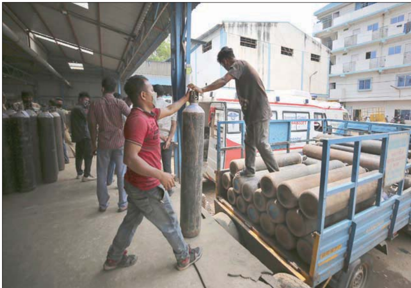
عمال ينقلون اسطوانات أكسجين إلى مستشفى في بنغالور أمس

ومساءً الثلاثاء، أكد مودي أن «الحكومة المركزية والولايات والقطاعات الخاصة تحاول أن يحصل كل مريض على كمية الأكسجين التي يحتاج إليها». لكن المستشفيات في ولاية ماهاراشترا (غرب) وعاصمتها