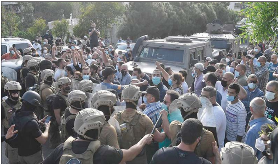
من المواجهات بين القوى الأمنية ومناصريين القاضية غادة عون أمس (مواقع التواصل)

بيروت، تثير رضا خرقتم المدعية العامة الاستثنائية في جبل لبنان، القاضية غادة عون، أمس، قرار مجلس القضاء الأعلى، وجددت تحركها باتجاه شركة «مكتف» لشحن الأموال، حيث تمت مؤازرتها من مناصرين لها ولد التيار الوطني الحر، ما أدى إلى تصادم مع القوى الأمنية التي حاولت إخلاء الساحة، ومنع الدخول إلى مكاتب شركة الصيرفة. ورفع هذا الخرق التحذيرات السياسية من «حالة التمرد» المتواصلة من قبل القاضية عون على القرارات القضائية، والمخاوف من «محاولة لإنهاء مؤسسة القضاء التي يراها عليها اللبنانيون»، كما قال نائب في كتلة «المستقبل» فيما بدا أن هناك اصطفاً سياسياً بين مؤيد لموقف القاضية عون ومعارض لها. وكما كانت القاضية عون قد اقتحمت الشركة مرتين متتاليتين في الأسبوع الماضي، للحصول على مستندات تقول إنها تحقق فيها، ضمن ملف التحقيقات المالية إلى الخارج، وغداة قرار إصداره مجلس القضاء الأعلى، يقضي بإحالة ملف القاضية إلى هيئة التفتيش القضائي، وكف يدها عن عدد من الملفات، من بينها ملف الجرائم المالية، خرقت القاضية عون القرار مرة أخرى، وتوجهت إلى شركة «مكتف» للصيرفة، حيث لم تسمح لها الشرية بالدخول إلى مكاتبها في عوكر لأن الشركة تعد أن الملف أصبح بيد القاضي سامر بعلب. وخلال نقل مباشر على التلفزيون، قالت عبارات تنسك فيها إهفال الشركة، وأكدت أن «أصحاب الشركة منعوني من الدخول بسيارتي، فدخلت سيراً على الأقدام»، وساعت «لقد منعوني من الدخول لأن الداتا فخصهم»، وطلبت من القضاء