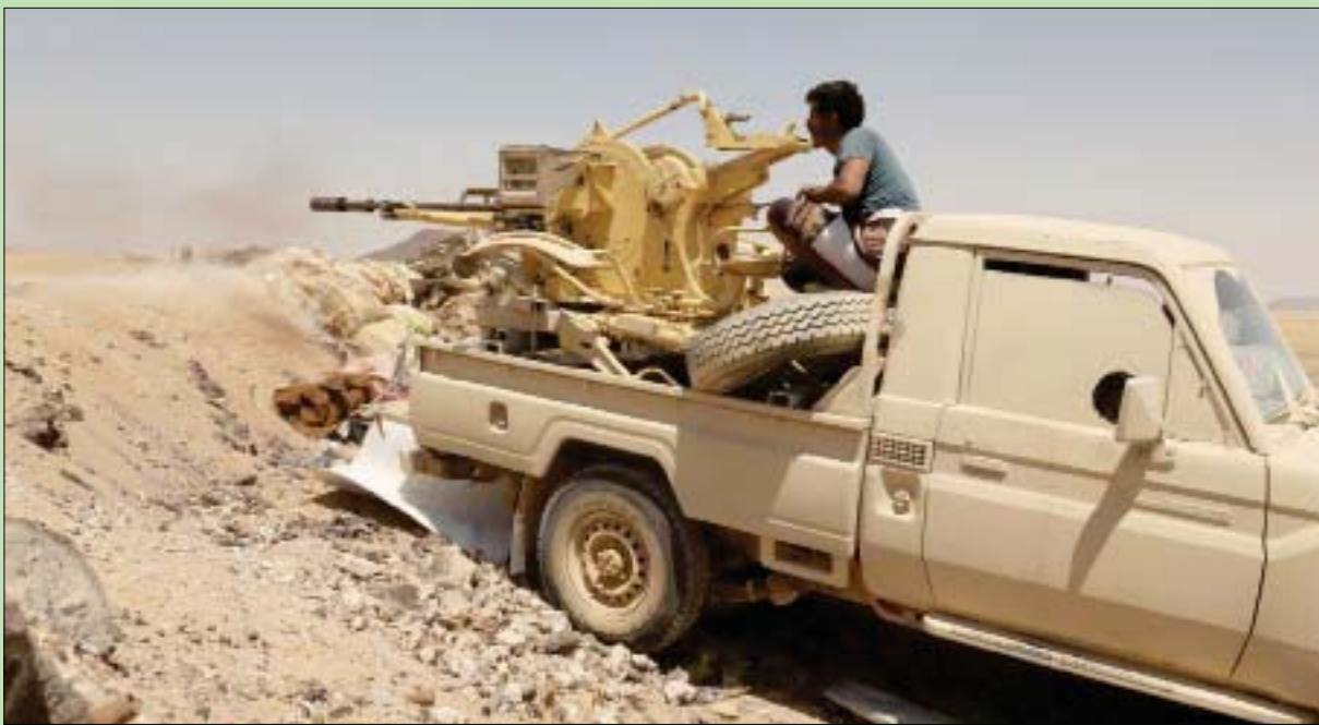
مقاتل في الجيش اليمني بإحدى الجبهات في مأرب

واختتم بالقول إن الدور السعودي مهم في إنهاء الأزمة، وإن الرياض مفتحة للمناقشة مع الحوثيين، وخير دليل على ذلك هو المبادرة الأخيرة التي تم تقديمها، متابعاً: «يجب أن ندعم الرياض في الدفاع عن نفسها من الاعتداءات الحوثية، وهم يريدون دوراً إيجابياً، كما أنهم منفتحون للتواصل مع الحوثي، ويدعمون اللواتي أقوم به، بيد أن الحوثي للأسف لم يلتزم بوقف إطلاق النار».