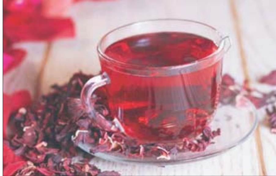
مشروب الكركدي السوداني