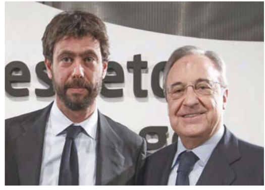
بيريز وإنييلي رئيسا ريال مدريد ويوفنتوس ما زالا يدافعان عن دوري السوبر

بدره، أصدر الاتحاد الإنجليزي لكرة القدم بياناً رحب فيه بخطوات الأندية التي تخلت عن مشروع الدوري السوبر، ومشيداً بالمشجعين على «صوتهم المؤثر والصريح». وقال الاتحاد الإنجليزي «تمتلك كرة القدم الإنجليزية تاريخاً تقدر به من الفرض لكل الأندية واجتمعت أطراف اللعبة كافة على رفض الدوري المغلق».