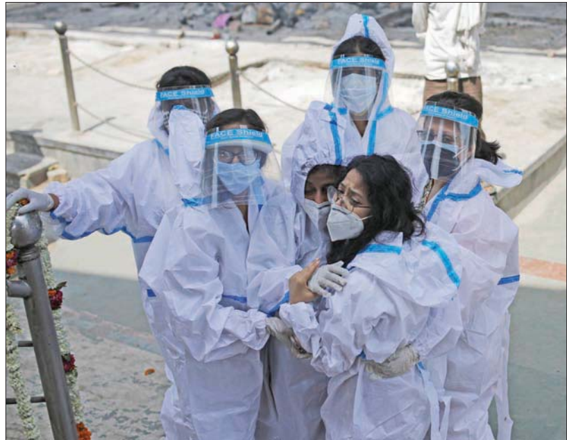
أفراد أسرة أحد ضحايا «كوفيد -19» يحضرون جنازته في نيودلهي أمس

معظم البلدان التي واجهت بكفاءة عالية الموجة الوبائية الأولى، هو السبب الرئيسي في الوضع المراهق الذي وصل إليه المشهد الوبائي. وتفيد المنظمة الدولية بأن التعثر في توريد اللقاحات، والتأخير في إطلاق حملات التطعيم، وإحجام نسبة عالية من السكان عن تناول اللقاح في بعض بلدان المنطقة، ساعد على هذه الموجة الجديدة وانتشار الطفرات السريعة.