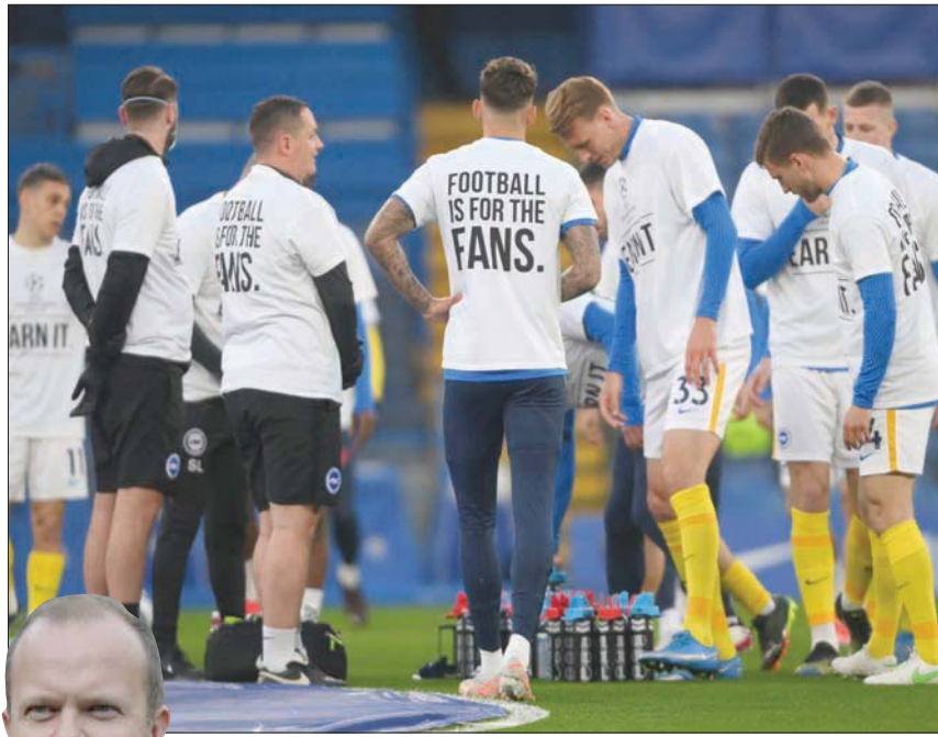
لاعبو فريق برايتون وضعا على قمصانهم شعاراً رافضاً لدوري السوبر

وقال سيفيرين «من المثير للتحديد الاعتراف بالخطأ، والمثير الأندية ارتكبت خطأ كبيراً، لكنهم عادوا إلى العائلة الآن، وأعرف تماماً أن لديهم الكثير ليقدموه ليس فقط لمسابقاتنا إنما لكل الكرة الأوروبية»، وأضاف «المضي قدماً هو الأهم الآن، إعادة