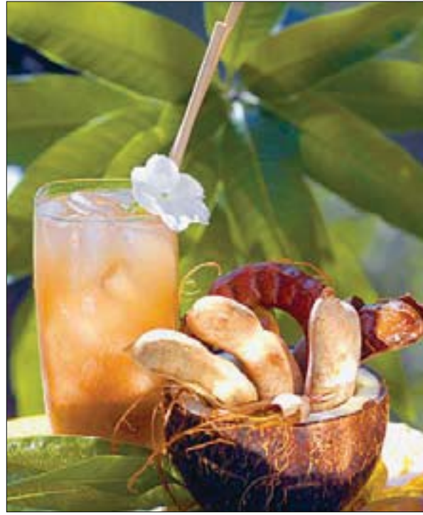
مشروب العرديب (التمر هندي)