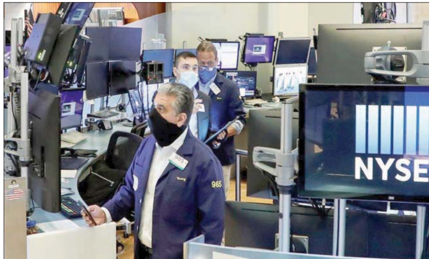
سماسة في «وول ستريت» يضعون كمادات خشبية «كورونا» التي أصابت اقتصاد العالم في مقتل

وفي التحليل الذي نشرته وكالة «بلومبرغ» للأبناء، قالت إندا كوران وسيمون كيندي إن كل المؤشرات تقول إن إجمالي الناتج المحلي للعالم سجل في العام الماضي أكبر تراجع له منذ الكساد الكبير في ثلاثينيات القرن العشرين.