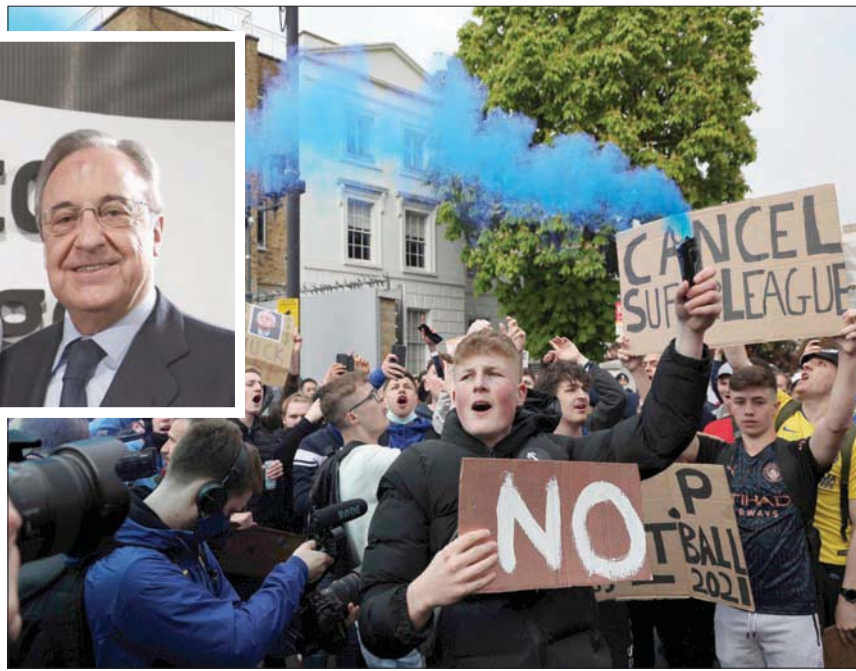
الجماهير الإنجليزية الغاضبة خارج ملعب تشيلسي كان لها الفضل في تغيير المسار

إد وودوارد نائب الرئيس التنفيذي لمانشستر يونايتد أول ضحية للبطولة الانفصالية