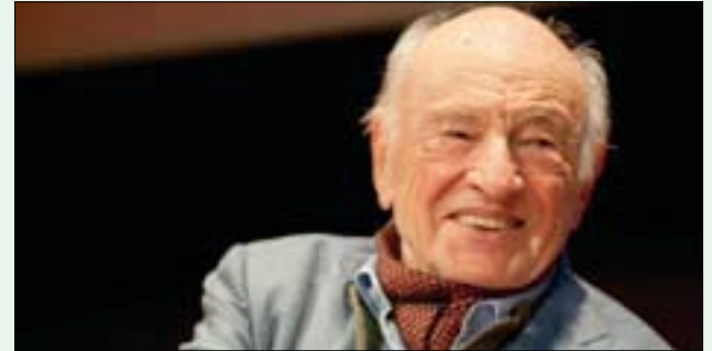
الفيلسوف الفرنسي إدغار موران