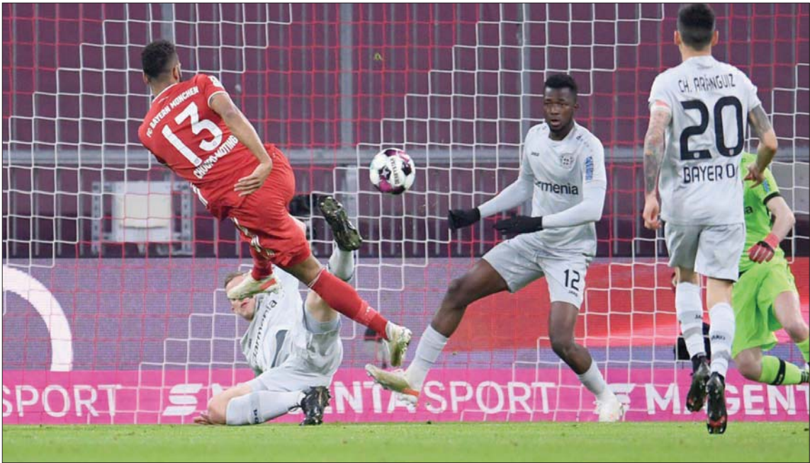
تشوبو موتينغ مهاجم بايرن (رقم 13) يسدد في شبك ليفركوزن مسجلاً هدف فريقه الأول

لم يكن مثالياً، يمكننا الآن حسم الدوري. المدرب يستحق أن نقدم كل ما لدينا من أجله، لقد قضينا الفترة الأكثر نجاحاً خلال آخر عام ونصف العام». ورغم الخسارة في المقابل، ما زال لايبزيغ في وضع مريح على صعيد الوصافة، إذ يتقدم بفارق سبع نقاط عن فولفسبورغ قبل مواجهة الأخير مع شتوتغارت. لكن على لايبزيغ الذي يخوض في 30 الحالي نصف نهائي