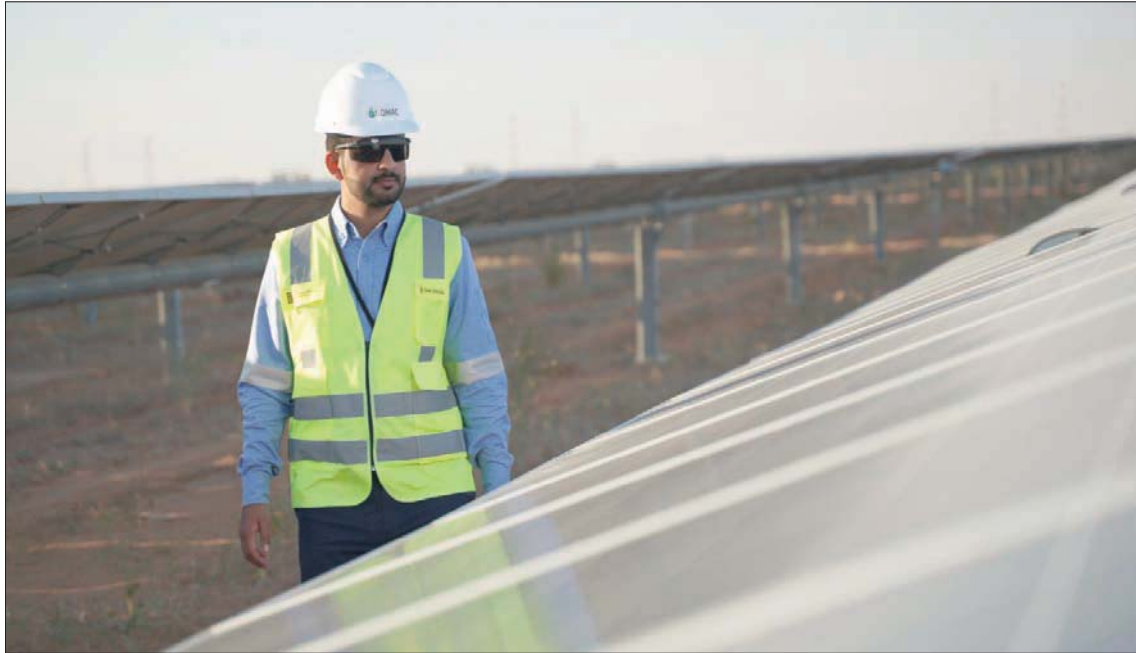
السعودية تقود المنطقة للاستدامة البيئية والتحول نحو الطاقة البديلة والمتجددة (الشرق الأوسط)

في مجال تحول الطاقة قد يُطلق فوائد كبيرة لمختلف دول المنطقة.