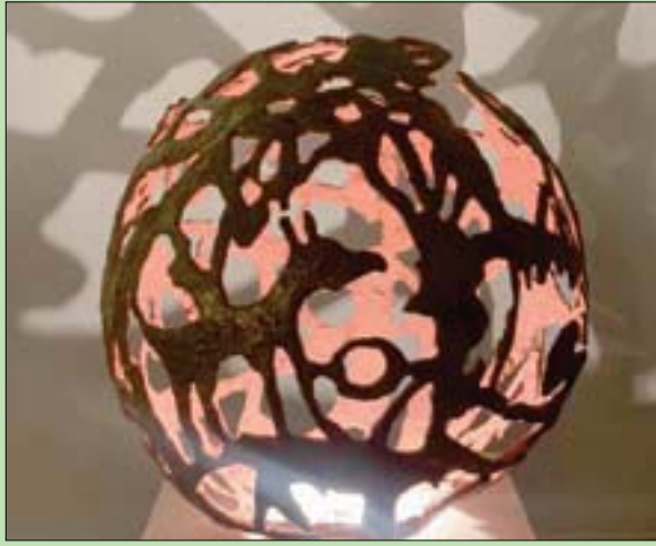
أعمال متنوعة من معرض «النحت وسنيته»