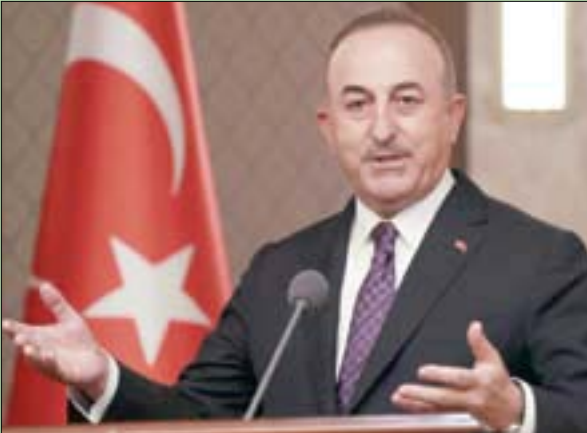
جاويش أوغلو خلال مؤتمر صحفي في أنقرة الأسبوع الماضي

وتابع «علينا من ينتهج خطابات ذات نبرة حادة داخل المعارضة المصرية في تركيا ضبط الخطاب الإعلامي قبل البدء في خطوات التطبيع، تركيا تتعامل بحذر مع الخطابات المتطرفة ذات