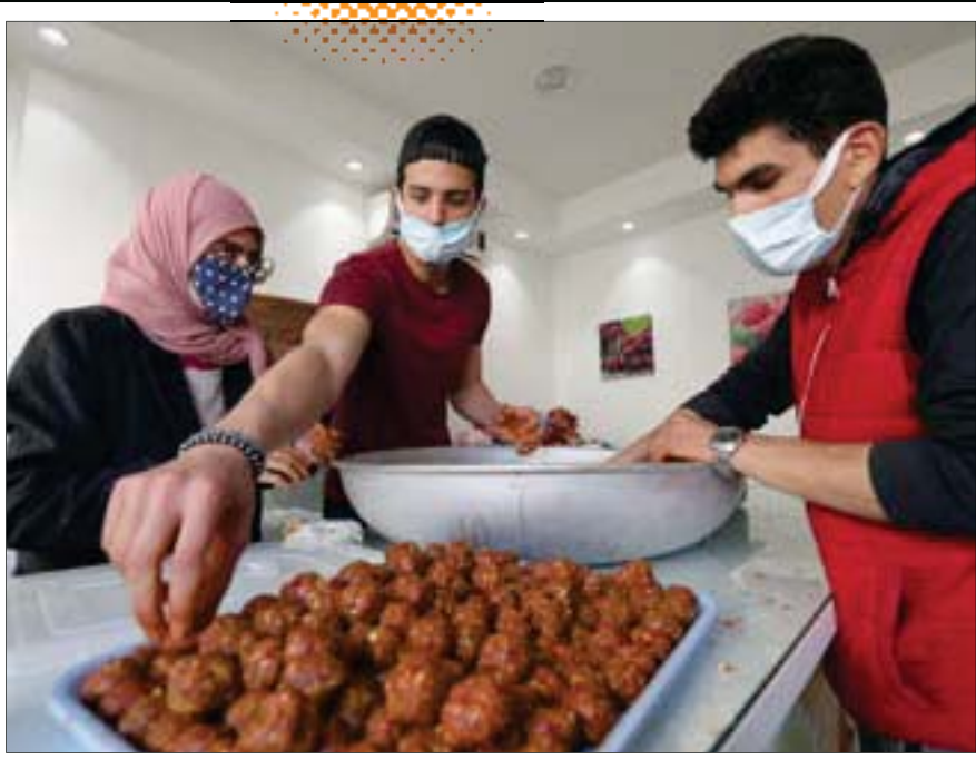
متطوعون تونسيون يعدون وجبات الطعام للمحتاجين من المواطنين والمهاجرين الأفارقة في رمضان بالعاصمة تونس