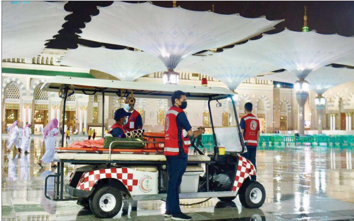
متطوع الهلال الأحمر في خدمة زوار المسجد النبوي

الرياض، «الشرق الأوسط»، ضاعفت دول خليجية أمس (الأربعاء) من القيود المتخذة لتجنب انتشار فيروس كورونا المستجد (كوفيد - 19)، وذلك بتعليق السفر إلى عدد من الدول وتشديد الرقابة على المناطق العامة والأسواق التجارية للوقوف على مدى الالتزام بتطبيق الإجراءات الاحترازية والوقائية وفرض العقوبات على المخالفين للبروتوكولات الصحية المعمول بها للحد من انتشار فيروس كورونا.