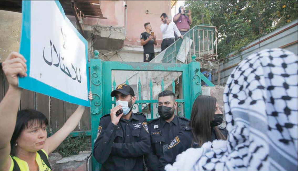
فلسطينيون وإسرائيليون تظاهروا الجمعة ضد طرد سكان حي الشيخ جراح من بيوتهم

بمنازل المواطنين وترحيلهم منها، كما يجري في حي الشيخ جراح بالقدس المحتلة، وتقوم الملكة عاتمة، بحسب وكالة الصحافة الفرنسية. وأكد الفايز أن تثبيت حق هؤلاء المواطنين بالبقاء في بيوتهم وحماية حقوقهم، توابت دائمة في جهود الملكة من أجل إسناد الفلسطينيين. ويواجه أهالي الشيخ جراح في القدس خطر طردهم من منازلهم في الحي، بعد قرار محكمة إسرائيلية بإجلاء عائلات. ويتهدد القرار الإسرائيلي 12 عائلة، بشكل فوري، وهم عائلات تعيش في «حي كرم الجاعوني» منذ عام 1956،