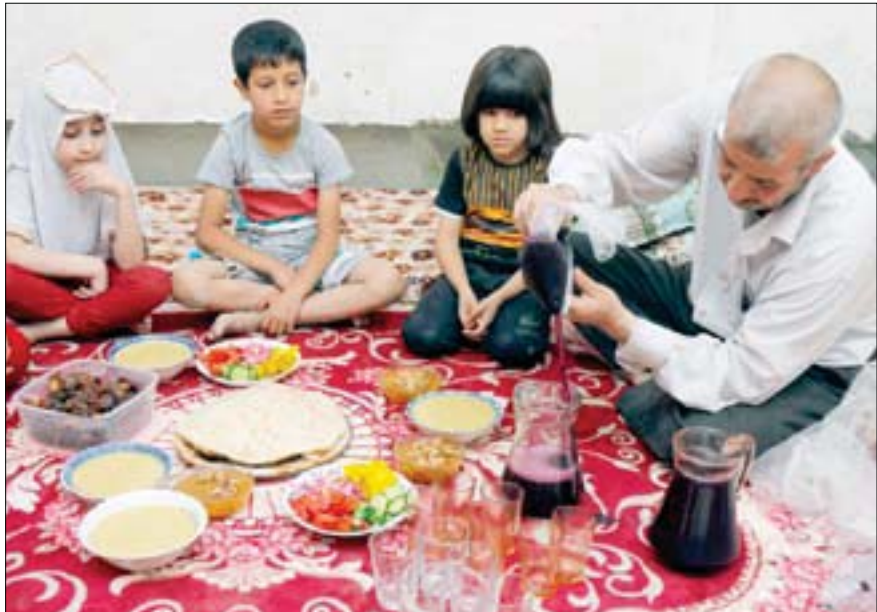
عراقي يصب عصير الزبيب لعائلته أثناء تناولهم وجبة الإفطار خلال رمضان في الموصل