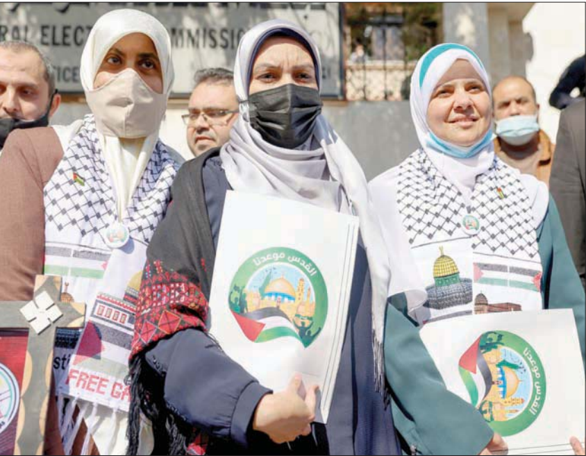
وصول ممثلين عن «حماس» لتسجيل قوائمهم الانتخابية في غزة الشهر الماضي

دولة فلسطين من أجل مناقشة توفير المناخ والبيئة الملائمة، لإجراء الانتخابات بكامل الأراضي الفلسطينية بما فيها القدس الشرقية. وقال سفير فلسطين لدى الاتحاد الأوروبي، عبد الرحيم الفخرا، إن المسؤولين الأوروبيين جددوا رفضهم القاطع لوضع عراقيل أمام إجراء الانتخابات الفلسطينية.