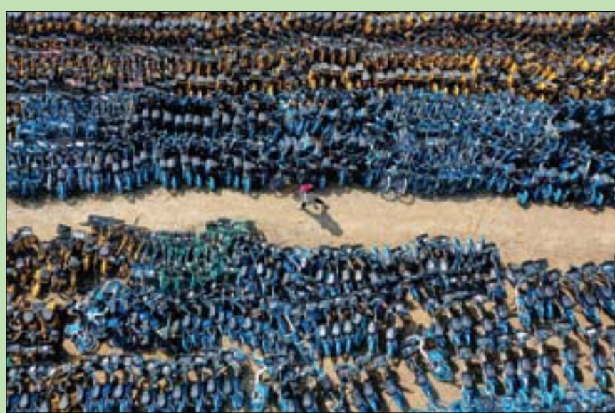
دراجات هوائية مهجورة في شنغهاي

كابوساً إدارياً للبلديات التي اتخذ بعضها تدابير للحد من أعدادها. في شنغهاي، عاصمة مقاطعة لياونينغ (شمال شرق)، ساحة شاعرة ضخمة تحوي آلاف الدراجات الهوائية ودراجات السكوتر الكهربائية غير المستخدمة حالياً. وسارت المجموعات الصينية الرئيسية في السنوات الأخيرة لغرض نفسها في سوق مشاركة الدراجات الهوائية قبل انفجار الفقاعة. في بداية عام 2018، اخذت الشركة الصينية الناشئة «أوفو» من السوق وانهارت تحت وطأة الديون. ويحدث حدوث أضرار أو عمليات سرقة للدراجات المشتركة في الصين لكن بعضها متروك في أماكن غير قانونية والعديد منها يتراكم قرب مداخل المترو. وفي مواجهة ذلك، تحركت بعض البلديات، وخطت بكين على سبيل المثال، لإزالة 44 ألف دراجة من مناطقها الحضرية هذا العام بهدف تقليص أسطول العاصمة إلى 800 ألف دراجة.