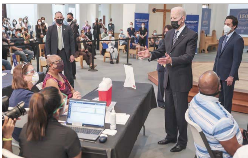
بايدن لدى زيارته مركزاً للتلقيح ضد «كورونا» بفيرجينيا في 6 أبريل (أ.ب.)

وخلال خطابه بالبيت الأبيض، أمس (الأربعاء)، شدد بايدن على ضرورة تضافر الجهود لاستكمال خطة توفير اللقاحات لكل البالغين من سكان الولايات المتحدة، مطالبا أصحاب الأعمال بإنجاح الموظفين بإجازة مدفوعة الأجر للحصول على اللقاح، وتقديم حوافز مالية لمن يحصل عليه. وقال بايدن «لقد حققنا هدف الوصول إلى 200 مليون جرعة لقاح خلال 93 يوماً، هذا إنجاز عظيم لأن الأمر كان سيأخذ منا 220 يوم، أي بحلول سبتمبر (أيلول) المقبل». وأكد الرئيس الأمريكي، أن 50 في المائة من الأميركيين قد حصلوا بالفعل على الجرعة الأولى من اللقاح على الأقل، ويشكل كبار السن (فوق 65 عاماً) الغالبية بنسبة 80 في المائة. وقال «لقد فققنا أرواحاً كثيرة، لكننا أيضاً أنقذنا أرواحاً كثيرة، وتابع بايدن «أنا فخور أن اللقاح