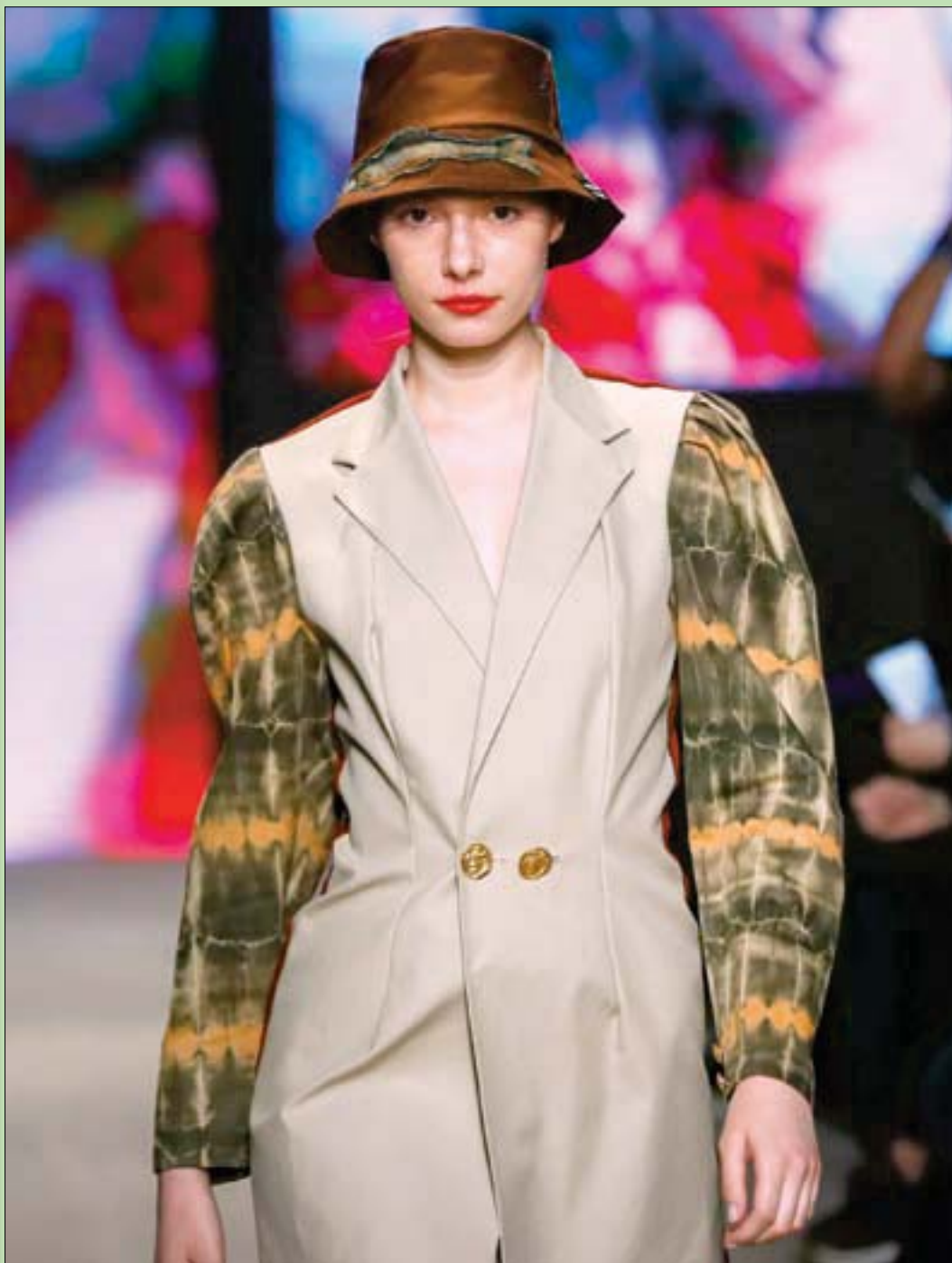
عارضة تقدم زياً للمصممة الروسية جيردا إيرين خلال أسبوع الموضة في موسكو الذي يستمر حتى يوم 24 أبريل

وبدوري أقول: انتهت الحكاية، وبالتبات والنبات، وتخلفون صبيان وبنات).