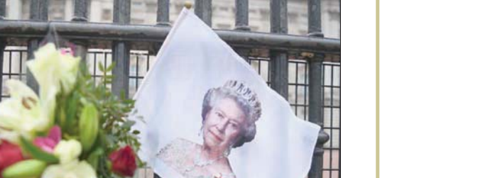
زهور وصور للملكة إليزابيث أمام قصر باكنغهام

بمفردها. يأتي ذلك في الوقت الذي يقم فيه أفراد العائلة الملكية أسبوعين من الحداد بعد وفاة فيليب في 9 أبريل (نيسان) عن عمر يناهز 99 عاماً.