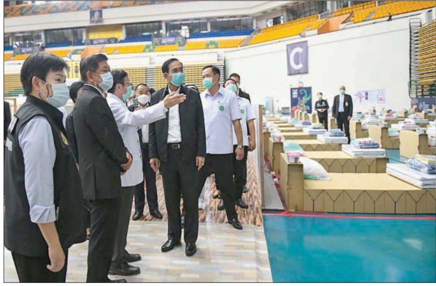
رئيس وزراء تايلند يزور مستشفى ميدانياً لمرضى «كوفيد -19» أمس

وقدّرت منظمة الصحة أن ربع الإصابات اليومية الجديدة في العالم تسجل حالياً في الهند التي اقترب عداها اليومي من 300 ألف إصابة، مع الإضافة إلى أنه نظراً لعدد السكان المرتفع (1,4 مليار نسمة)، ما زالت نسبة الإصابات في الهند لكل مائة ألف مواطن أدنى مما هي عليه في البلدان الأوروبية. لكن يقول خبراء المنظمة إن هذه الأعداد المرتفعة هي التي تشكل الخطر الفعلي في بلد مثل الهند يعاني من ضعف المنظومة الصحية، وعدم قدرتها على مواجهة تفاقم الوضع الوبائي إذا استمر على هذه المنويرة. وكانت الحكومة قد أعلنت، يوم الاثنين