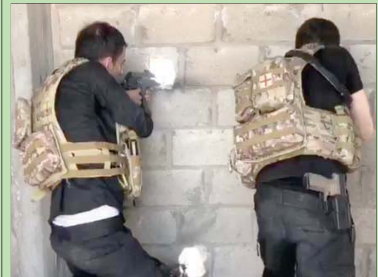
مقاتلان كرديان خلال اشتباكات مع موالين للنظام السوري في القامشلي أمس