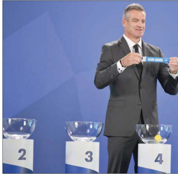
«الأخضر» وقع في مجموعة البطل والوصيف