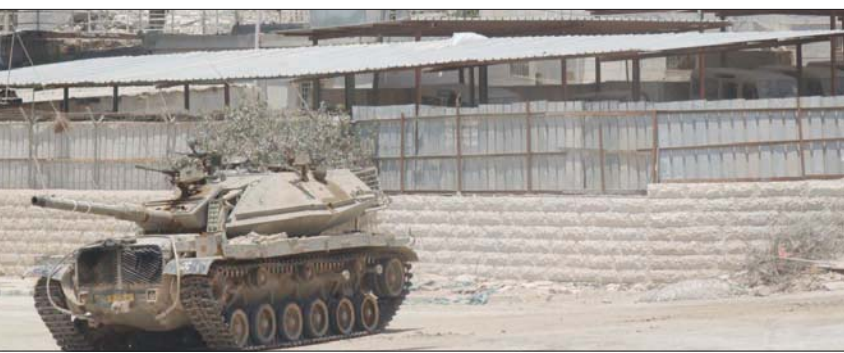
ديابة إسرائيلية بساحة مقر القاطعة في رام الله الأسبوع الماضي

وغيره من قادة «فتح»، من خسارة الانتخابات التشريعية المقرر إجراؤها الشهر المقبل، ويأن لديهم تقديرات ودراسات ميدانية تؤكد أن أبو مازن سيخرج من هذه الانتخابات وأنه الخاسر الأكبر، «وسيسجل في تاريخ شعبه على أنه القائد الذي أوصل حركة (حماس) إلى السلطة، وهي ضربة سيواجهها حركة فتح» صعوبة في