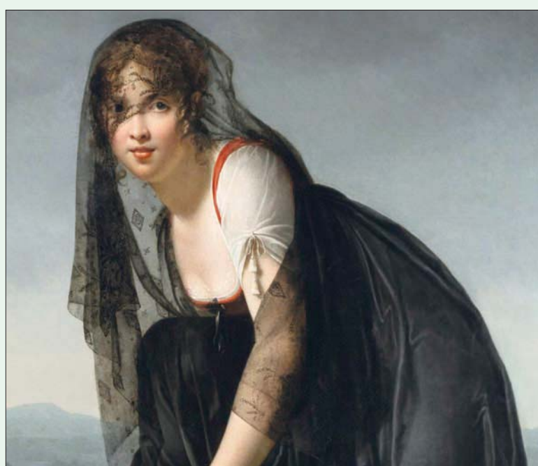
لوحة لماري دنديز فيليه

رسم مصغر على العجاج تجاهلن. والحال هي: كيف سيتمكن من إيجاد الوقت الكافي ليكن في الوقت ذاته زوجات حريصات، وأمهات، مضحيات، وخادمات يقظات في بيوتهم، ثم يرسمن؟ إن من المستحيل القيام بذلك بشكل جيد؟ هذا ما كتبه أبي دو فونتين في عام 1785. لكن رغم الانتقادات، حاولت الرسامات إيجاد موضع قدم لهن مساو لموقع زملائهن الذكور. في سياق الاضطرابات السياسية الكبيرة، أي السنوات الأخيرة من الحكم الملكي وبدايات الثورة الفرنسية، تم ما يمكن وصفه بـ«الثاني» الفنون الجميلة، أو بالأحرى تسليط ضوء مفاجئ على الرسامات. وهي كانت مجرد مرحلة قصيرة من الرسومات التي كانت بمثابة إعادة اعتبار لهن. وهو معرض وصفه النقاد بأنه «ثورة النساء اللواتي أسكنن الفرشاة». وهناك دراسة شاملة عن كل واحدة من صاحبات اللوحات السبعين المختارة للمعرض، مع سيرة لها ولما صادفته من صعوبات في سبيل أن تصبح رسامة.