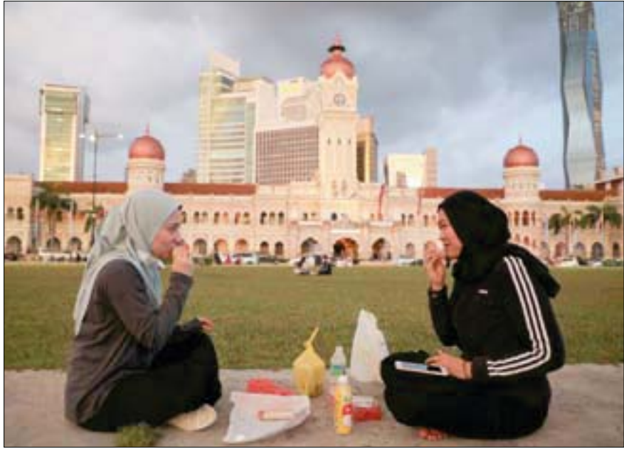
ماليزيان تفطران في ميدان الاستقلال في كوالالمبور خلال الشهر الفضيل