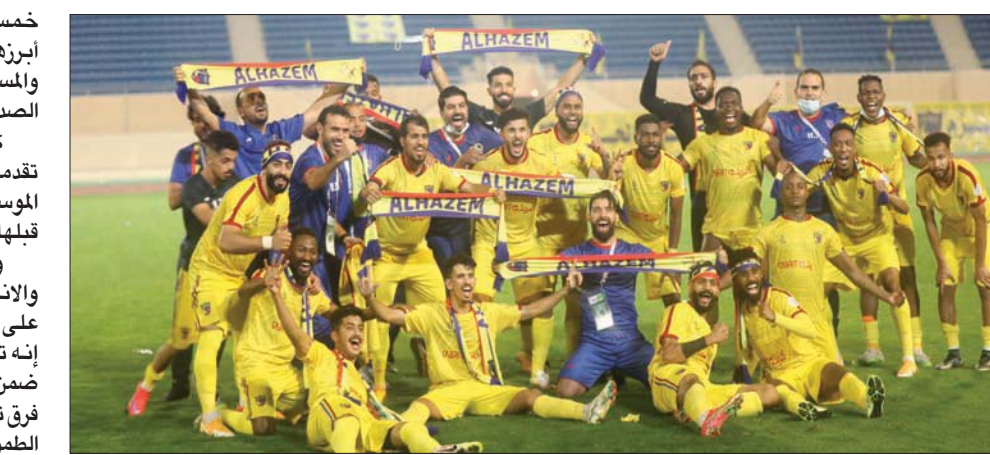
لاعبو الحزم يحتفلون بعودتهم إلى دوري الأضواء