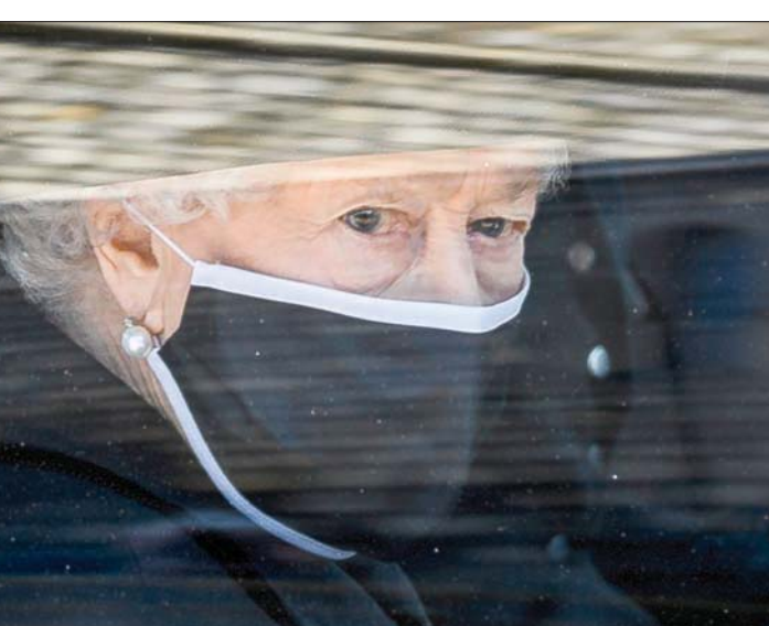
الملكة إليزابيث أثناء جنازة زوجها الراحل الأمير فيليب يوم السبت الماضي