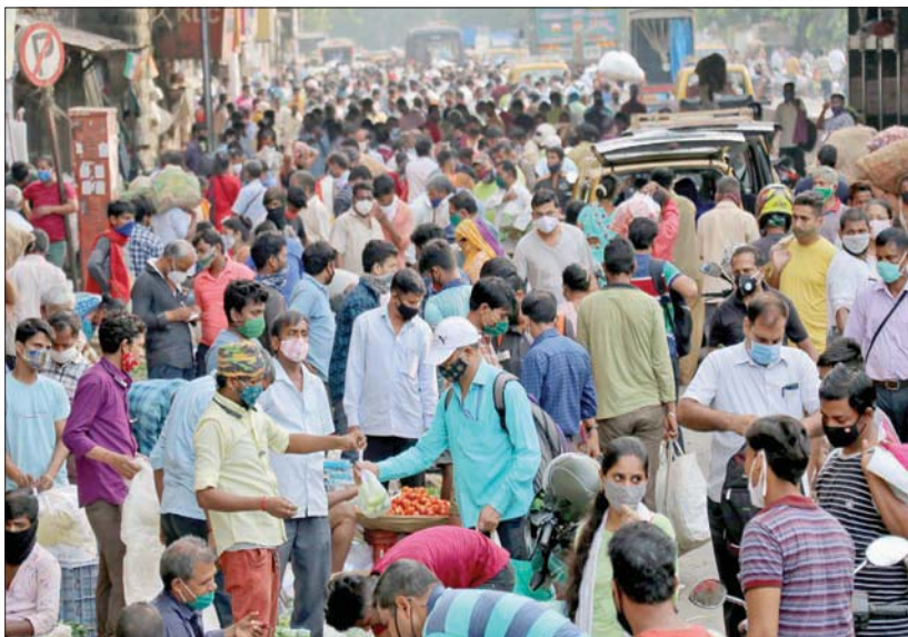
أشخاص يقفون مستلزمات في سوق مكتظة بمومباي أمس