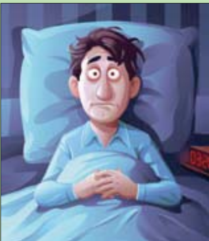
صلة بين مدة النوم والإصابة بالخرف

باريس - لندن، «الشرق الأوسط» وفق دراسة جديدة تابعت نحو ثمانية آلاف بالغ بريطاني لأكثر من 25 عاماً، تبين أن لنوم ست ساعات أو أقل في الليلة بين سن الخمسين والسبعين صلة بزيادة خطر الإصابة بالخرف. وكانت قد أظهرت الدراسة التي نُشرت في مجلة «نيتشر كومونيكيشنز» أن خطر الإصابة بالخرف يكون أعلى بنسبة 20 إلى 40 في المائة لدى الأشخاص الذين