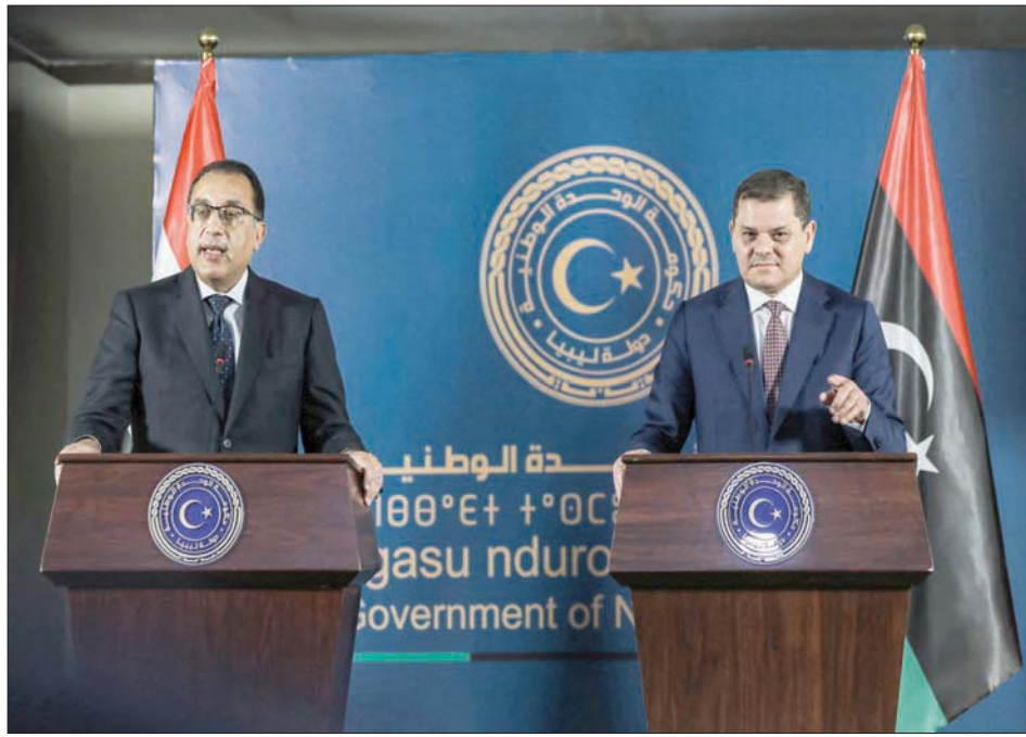
مؤتمر صحافي للديبية ورئيس الحكومة المصرية في طرابلس أول من أمس

الحدودية لمكافحة الأمراض السارية، ومكافحة الوضع الصحي الوبائي. كما دعا البيان لإنشاء منظومة معلومات، وقاعدة بيانات مشتركة لمكافحة الإرهاب، ورصد ومعالجة وتبادل المعلومات حول الأنشطة الإرهابية، وحصر العناصر الإرهابية في البلدين، وإعداد دليل موحد للعمليات التابعة للدول الأخرى، التي تيسر رحلاتها إلى مصر، ما يسهل تنقل المواطنين بين البلدين. كما تقرر تشكيل مجموعة عمل مشتركة من الاختصاصيين بالبلدين في مجال الزراعة والثروة البحرية، وفتح الخطوط البحرية للركاب والشحن بين موانئ البلدين، والتعاون في مجال الرعاية الصحية الأولية، وتشكيل لجنة مشتركة بالمناطق