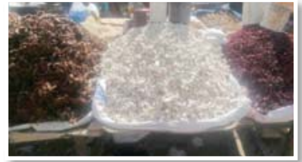
نباتات العرديب والقونقلين والكرادي

واحدة في العام، وثمرتها على شكل وعاء قشري، يحتوي على عدد كبير من الثمار، لا ينطق ذاتياً، بل يتم كسره لإخراج البذور المغلفة بالمادة «البيضاء» التي يتم جمعها وتحويلها إلى «بدر قونقلين»، التي تستخدم كعصير. وتحيط بشجرة التبدلي الكثير من الأساطير وحالة من التقديس، وينظر إليها عند بعض الشعوب باعتبارها «شجرة الحياة» ورمز الخصوبة، وشراب القونقلين يجعل من متعاطيه قوياً وشجاعاً، فهو «شراب الأبطال». وتؤكل أوراق الشجرة أيضاً على شكل خضار طازج، تقدم مع زيادة الفول السوداني، وهي غنية بالسكريات والبروتينات وفيتامين سي، وتستخدم كعلاج شعبي لبعض الأمراض مثل الحمى وأمراض المعدة ووقف النزيف وعلاج للإسهال والدستاريا، وتقوية جهاز المناعة ومنع فقر الدم، وتحسين صحة الجهاز الهضمي والحفاظ على بشرة صحية ودعم خسارة الوزن وخفض ضغط الدم. ومثلما يتم تناول عصير القونقلين، فقد راج بين طلاب المدارس والجامعات، تناوله مخلوطاً مملحاً، ويضاف إليه «الليمون والدكوة» بعد «بله» بالماء، كنوع من المشهيات، نجد قبولاً بين الشباب من الجنسين على وجه الخصوص.