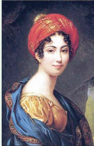
جولي دوفيدال رسمت نفسها

هذه الأسماء للرسامات اللواتي عملن بين نهاية القرن الثامن عشر وبداية القرن التاسع عشر ليست أكثر الأسماء التي يتم الاستشهاد بها في كتب تاريخ الفن. إنها أقل شهرة من أقرانهن الرجال لدى عامة الناس. ومع ذلك، فإنهن ينتمين إلى فريق الفنانين العديدين الذين ساهموا في تألق الفن التشكيلي الفرنسي. ولم يكن نادراً أن تخترق إحداهن «ورشات السادة الرجال» وصالات المعارض أو أن تحصل على تكليف من الدولة لإنجاز عمل ما. ورغم هذا واصل النقد تجاههن. والحال هي: