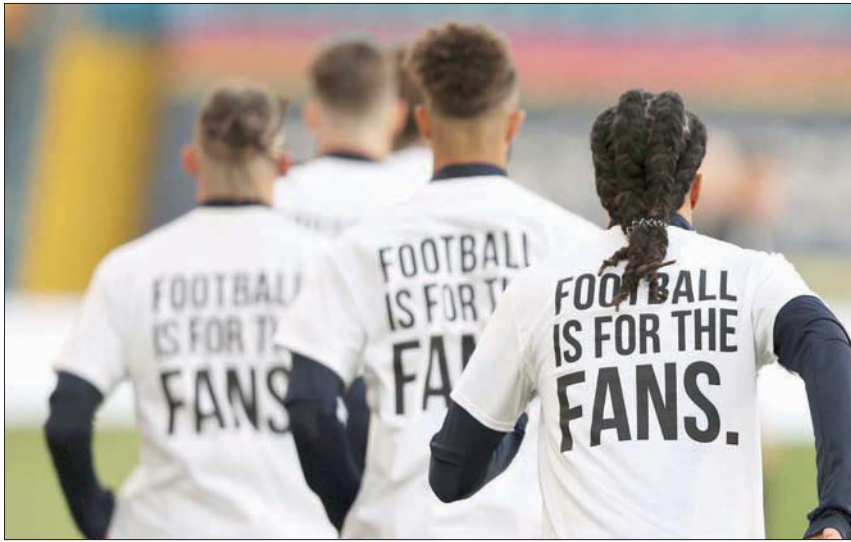
لاعبو ليدز وضعوا على قمصانهم شعار الكرة من أجل الجماهير رفضاً لدوري السوبر