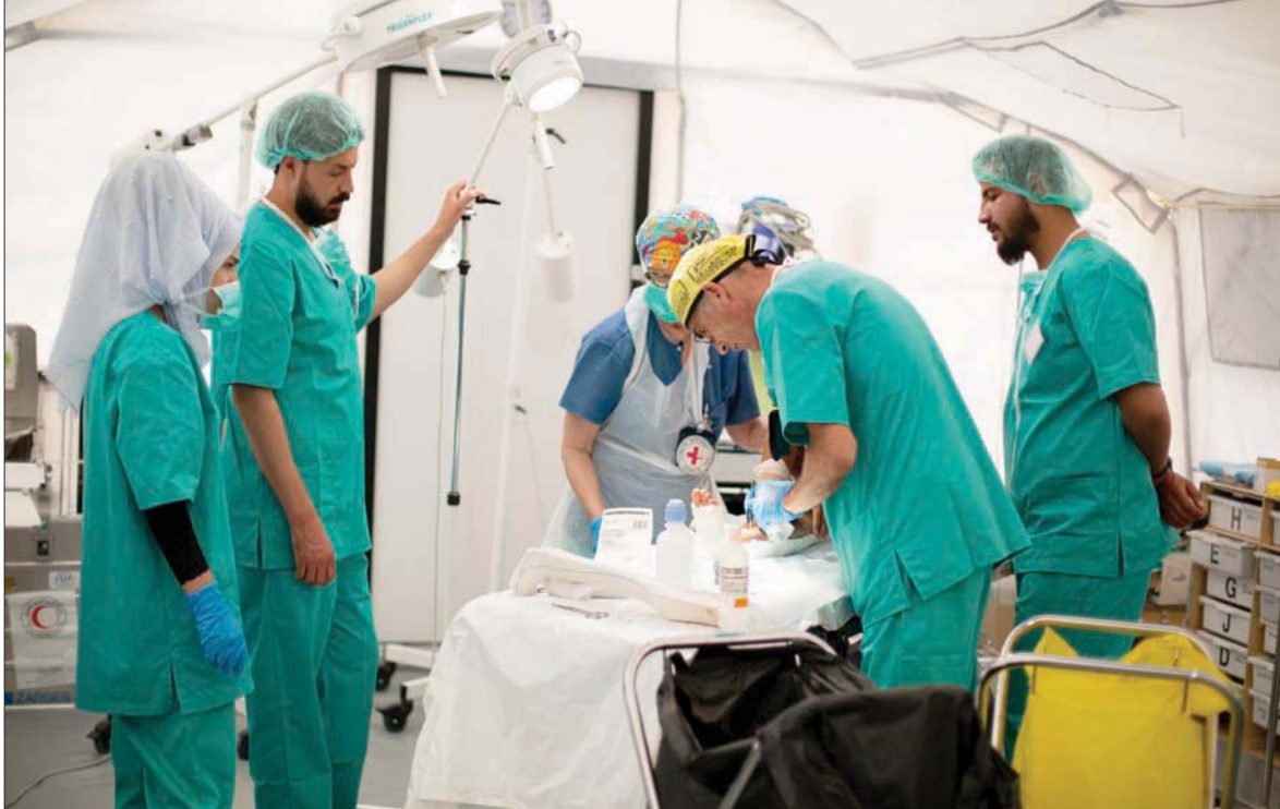
معالجة مصاب في «مركز جيان كوفيد - 19» شرق سوريا

في مدينة القامشلي، إن المركز وطاقمه وكوادره الطبية في حالة جاهزية تامة لاستقبال المصابين بالفيروس، الذين يتم نقلهم بواسطة سيارات الإسعاف التابعة لمنظمة الهلال الأحمر الكردية، أو الذين ينقلون إلى المركز من قبل ذويهم، وأشار إلى وجود 38 مصاباً بالفيروس «يتلقون الرعاية الصحية اللازمة بينهم 3 مصابين حالتهم حرجة، فيما الآخرون يمتثلون للشفاء». وعن أعراض الإصابة بالجائحة، أضاف حيو قائلاً: «بعضهم يعاني من ضيق التنفس وارتفاع حرارة الجسم، بينما يشكو آخرون من الأم جسدية يرافقها التهاب أمعاء وإسهال وآلم الكلى، وانخفاض نسبة الأكسجين في الدم الأمر الذي يسبب جلطة دموية»، مشيراً إلى أن الموجة الثالثة لوباء «كورونا» تعد الأكثر خطورة والأسرع انتشاراً من الموجات السابقة، «إذ تصيب كافة الفئات العمرية، فيما تشكل خطراً على الفئة الأكبر سناً، أي الذين تتراوح أعمارهم بين الـ45 عاماً وما فوق».