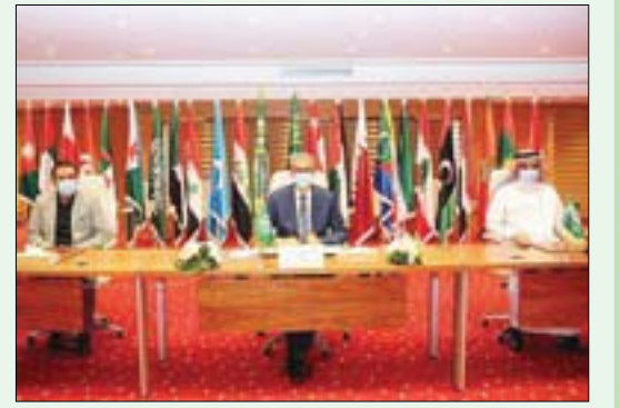
جانب من توقيع الاتفاقية التي ستكون منصة إلكترونية لاكتشاف الموهوبين العرب (واس)