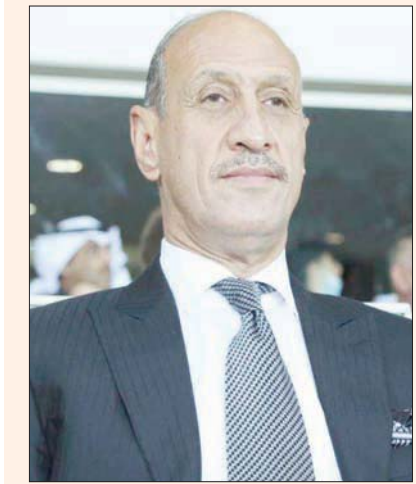
عدنان درجال (الشرق الأوسط)

وأكد مدرب الأهلي عدم قدرة مواطنه الكساندرو ميتريتا على المشاركة في مواجهة الليلة لمعاناته