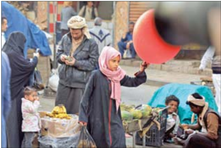
يمنيون يتسوقون في أحد الأسواق خلال شهر رمضان المبارك في العاصمة صنعاء