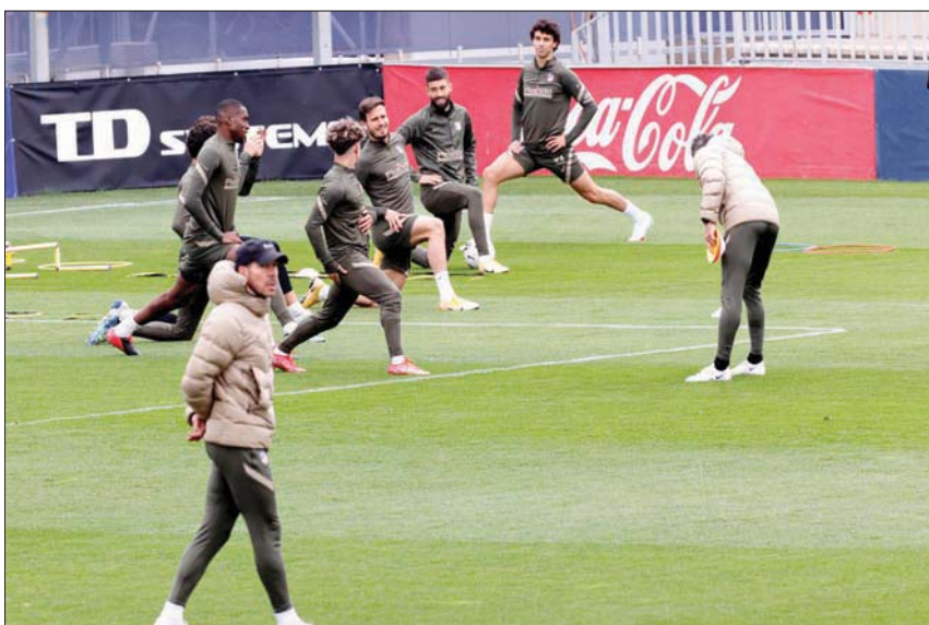
لاعبو أتليكو بقيادة المدرب سيميوني بديكون أن أي إهدار للنقاط سيفقداهم الصدارة

الأول بإشراف مديره الهولندي رونالد كومان، فيستقبل ختيفي غدا. وأعرب كومان عن ثقائه بقدرة فريقه على إحراز الثنائية المحللة بقوله بعد التتويج بالكأس: «أنا متفائل بقدرةنا على إحراز بطولة الدوري. كل مباراة ستكون في غاية الأهمية من الآن فصاعداً وسنقاتل حتى الرمي الأخير». يذكر أن برشلونة خرج الموسم الماضي خالي الوفاض تماماً وهو ما حصل له للمرة الأولى منذ عام 2008. وفي المباريات الأخرى، يلتقي أوساسونا مع فالنسيا، وليفانتي مع إشبيلية، وريال بيتيس مع أتلتيك بلباو، والأفيس مع فياريال، والتشي فيروس كورونسا عالمياً، فين الأندية الـ12 تريد البحث عن استقرار أفضل بالنسبة للمستقبل، والبطولة الجديدة ستضمن لها 3,5 مليار يورو (4,19 مليار دولار) لدعم