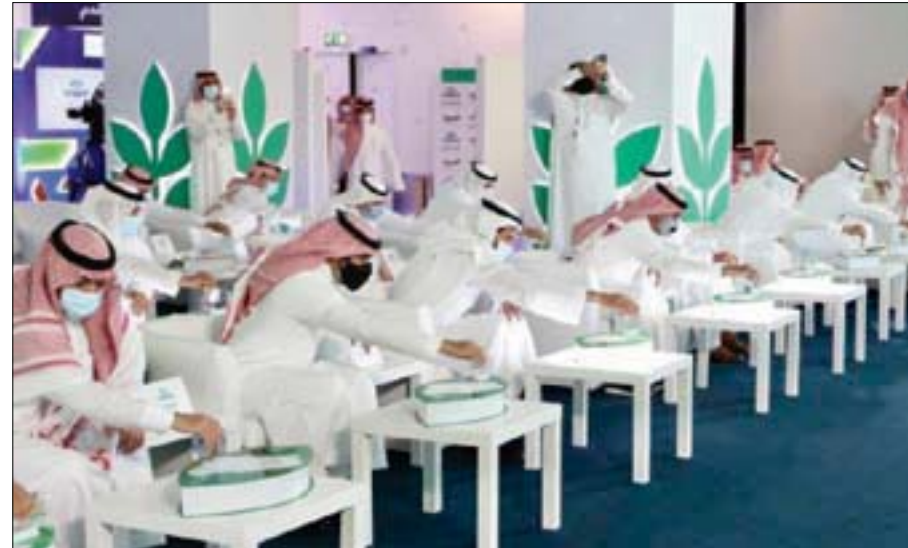
منصة «إحسان» أبرز المنصات لدعم العمل الخيري

وتخدم منصة «تبرع» أكثر من 150 جمعية خيرية في جميع مناطق المملكة، وتسعى للوصول إلى ما يربو على 20 مليون ريال هذا العام، حيث أفتى كبار العلماء على رأسهم مفتي عام المملكة ورئيس هيئة كبار العلماء الشيخ عبد العزيز آل الشيخ، بجواز إخراج الزكاة لمستفدي المنصات الخيرية، وذلك تحقيقاً للتكامل في المجتمع.