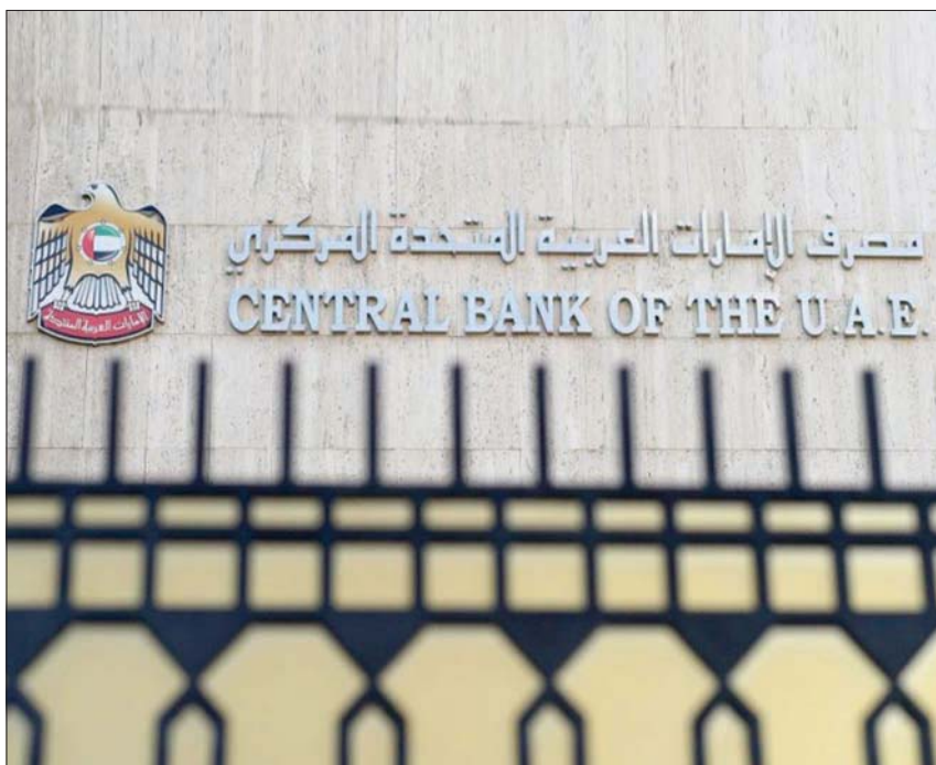
يتوقع مصرف الإمارات المركزي حرص المؤسسات المالية على ترتيب أولويات الإقراض من خلال خطة الدعم (وام)

وشكلت القروض التي حصل عليها القطاع نحو 44 بورز» للتصنيفات الائتمانية، إنه من المتوقع أن تحتفظ البنوك «بمصادر كافية للتنمويل السيولة» مع تعافي أسعار النفط. وأعلن بنك الإمارات دبي الوطني، أكبر بنوك دبي،