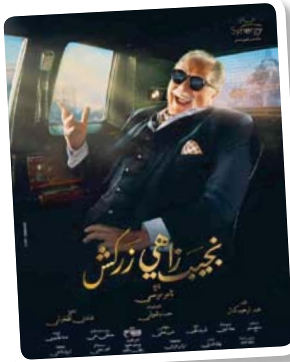
أفيش مسلسل «نجيب زاهي زركش»