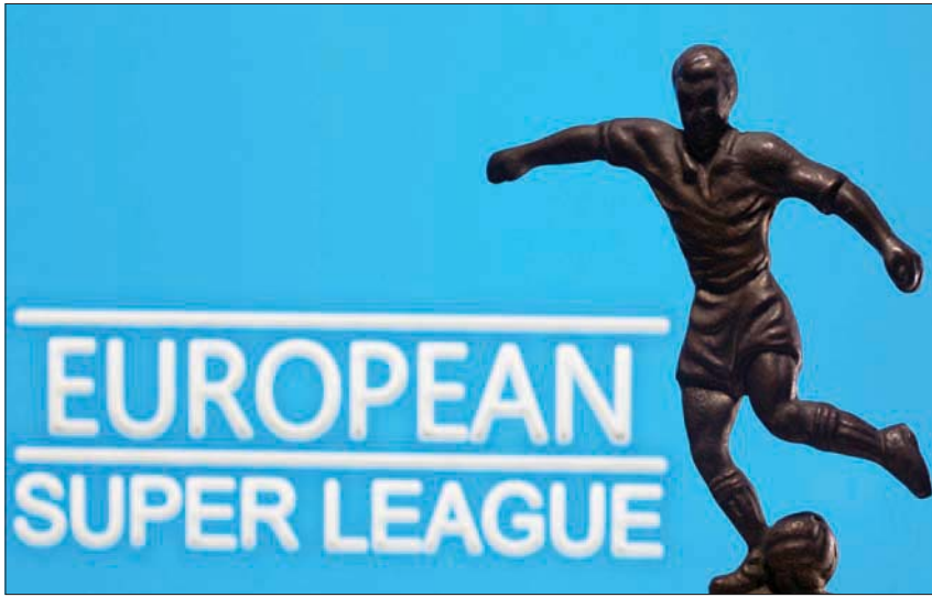
نموذج لشعار دوري السوبر الذي بات أكبر تحدٍ لبطولات القارة الأوروبية

لندن: «الشرق الأوسط» واصل رئيس نادي ريال مدريد الإسباني فلورنتينو بيريز، تحديه بالتحديد على المضي قدماً مع 11 نادياً كبيراً في أوروبا لتنظيم دوري السوبر للتحدي، في وقت هدد فيه الاتحاد الدولي والأوروبي هذه الفرق بالطرد من كافة المسابقات.