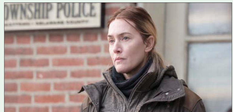
كيت وينسلت في لقطة من المسلسل «ماري أوف إيس تاون» (التش بي أو)

لوريا في التسجيلات، مضيئة «إنها محبوبة». في الوقت نفسه، أمضت وينسلت فترة من الوقت مع أفراد من الشرطة من العديد من الضواحي، ومن بينها إيس تاون، حيث تقول «لقد كانوا مجموعة من الأشخاص العظماء الذين كان بإمكانني الاتصال بهم (في أي وقت)». وتحدثت عن واحدة منهم تحديداً، وهي كريستين بلييلر، محققة شرطة مقاطعة تشيسترس، والتي كانت من بين مستشاريها في المسلسل، حيث كانت تحقق منها بشأن بعض الأمور الواقعية التي تخص شخصية «ماري».