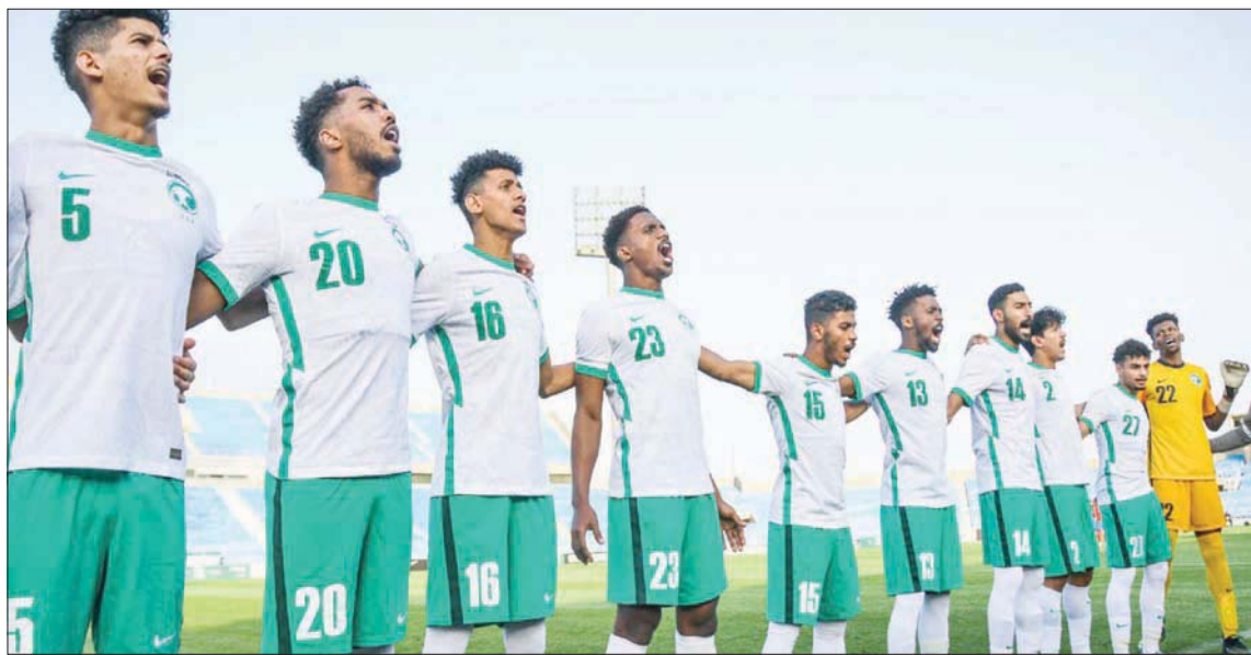
الأخضر يتربق اليوم ما ستسفر عنه قرعة أولبياد طوكيو (الشرق الأوسط)

وصنّف منتخب اليابان المضيف في المستوى الأول، إلى جانب نظيره البرازيلي الفائز بذهبية دورة ريو مع النجم نيمار،