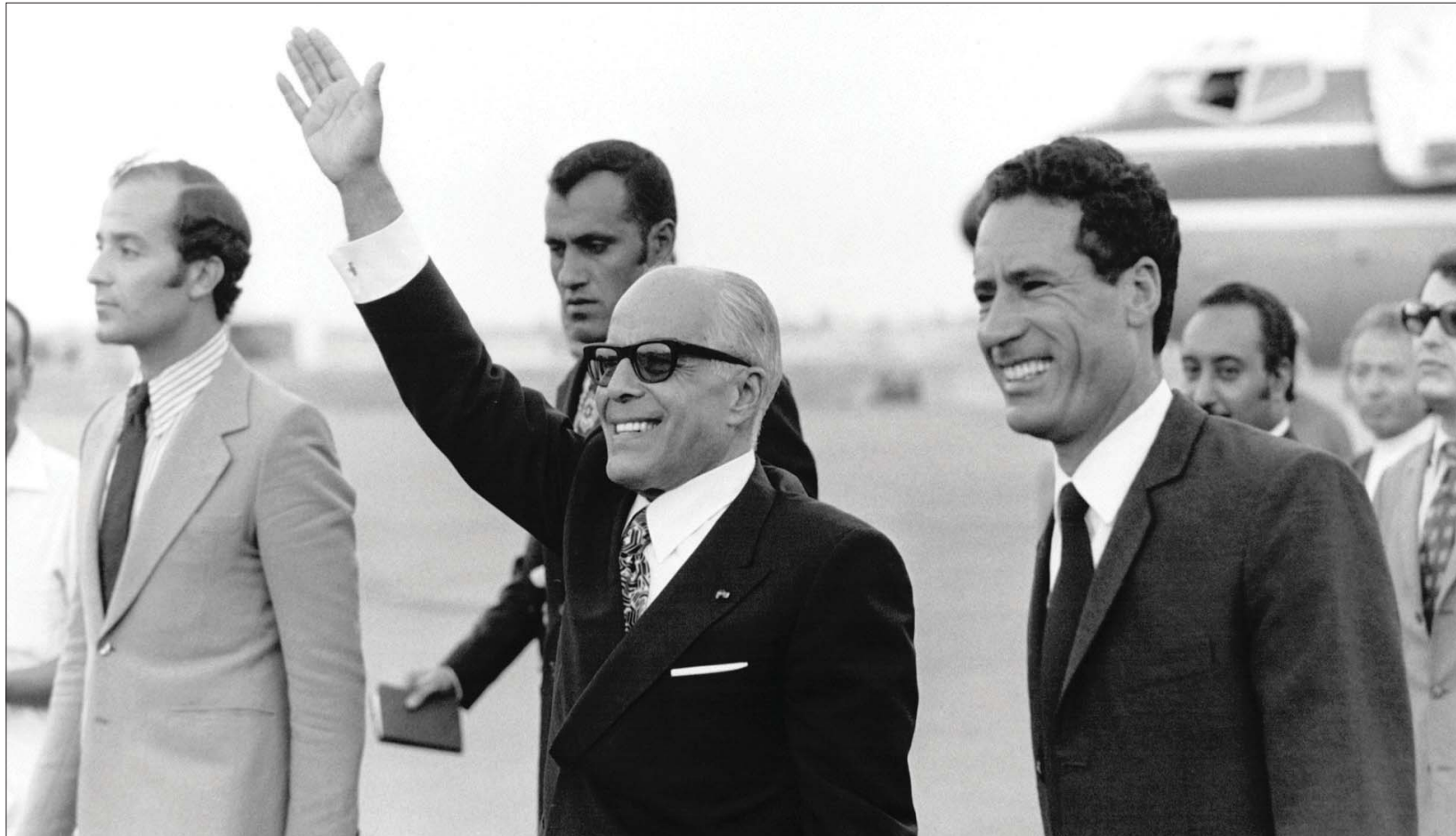
القذافي وبورقيبة في طرابلس عام 1973

لقد أدار العقيد عملية خروجه إلى العلن بوهبة فطرية كاملة تجاه الإعلام، سيعرفه العالم بها فيما بعد.