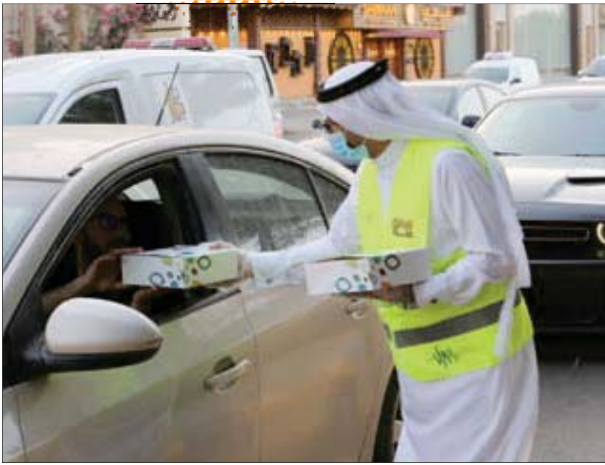
متطوع سعودي يوزع وجبة إفطار مقدمة من منظمة خيرية خلال شهر رمضان المبارك في العاصمة الرياض