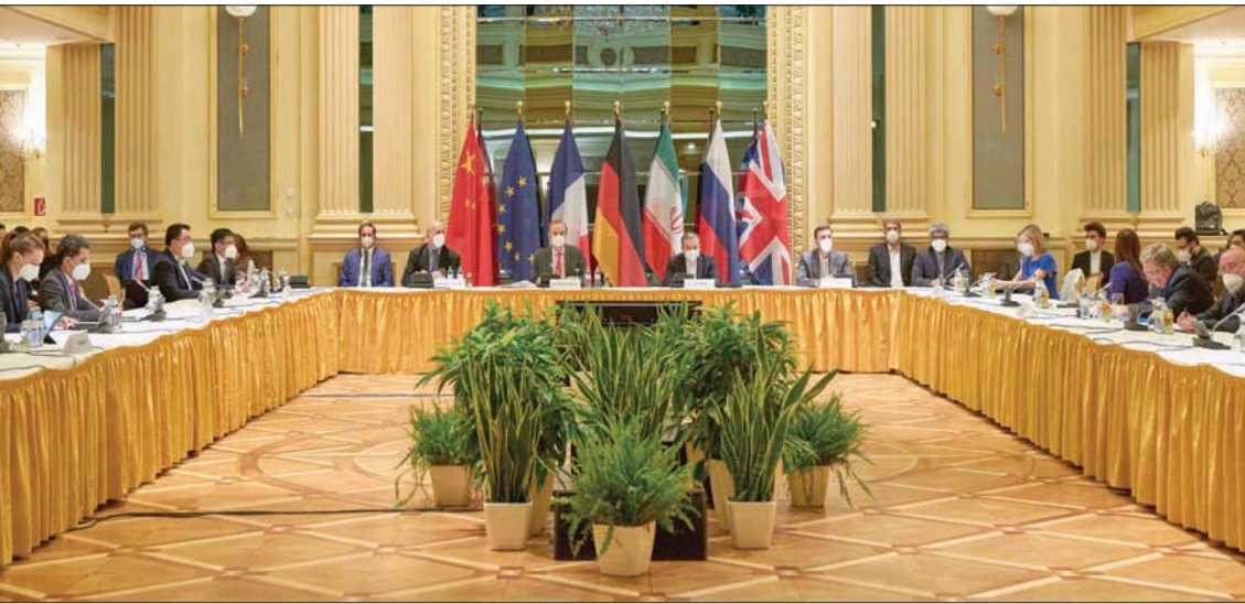
اللجنة المشتركة لأطراف الاتفاق النووي تعقد اجتماعاً لوفود الدول المشاركة بدون حضور الوفد الأميركي في فيينا أمس (أ.ب)

وقالت وسائل إعلام رسمية إيرانية إن «تقييم عباس عراقجي... أوليانوف، سفير روسيا إلى المنظمة الدولية في فيينا: «تقرر أخذ