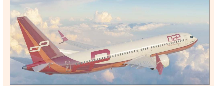
«دبي لصناعات الطيران» أعلنت في وقت سابق عن تسليم 18 طائرة من طراز «737 ماكس 8» إلى شركة «أميركان إيرلاينز»