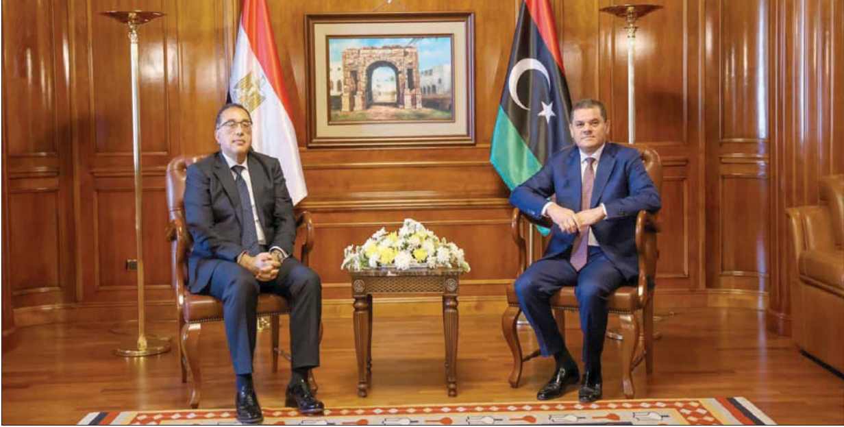
الديبية مستقبلاً نظيره المصري مصطفى مدبولي في طرابلس أمس

حفر في شرق البلاد، مقابل إدراج جهازي «الردع ودعم الاستقرار»، و«قوة مكافحة الإرهاب»، وهي في الأصل كيانات تضم ميليشيات مسلحة، في مقترح الميزانية. وكان الناطق باسم مجلس النواب، عبد الله بلحبق، قد أعلن أن الجلسة، التي عقدت بحضور أكثر من 97 وهو النصاب المطلوب، تم خلالها تداول 30 توصية من قبل لجنة الميزانية، تمهيدا لاتخاذ المجلس قرره النهائي. وقال بلحبق أمس إن أعضاء مجلس النواب صوتوا بالأغلبية على إعادة مشروع قانون الميزانية إلى الحكومة لتعديل، وفقاً لملاحظات المجلس ولجنة التخطيط والموازنة العامة المالية بالمجلس.