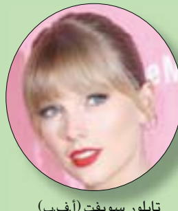
تايلور سويفت

العمر عرّفت عنه باسم هاتكس وجونسون واتهمته بالتسلل إلى ممتلكات الغير، بعدما استدعت إلى منزل المغنية في جنوب مانهاتن بعيد الساعة الخامسة والنصف مساء السبت. ولم توضح الشرطة مكان وجود المغنية خلال الحادثة، حسب وكالة الصحافة الفرنسية. وسبق لتايلور سويفت (31 عاماً)، التي أصبحت أخيراً مع البومها