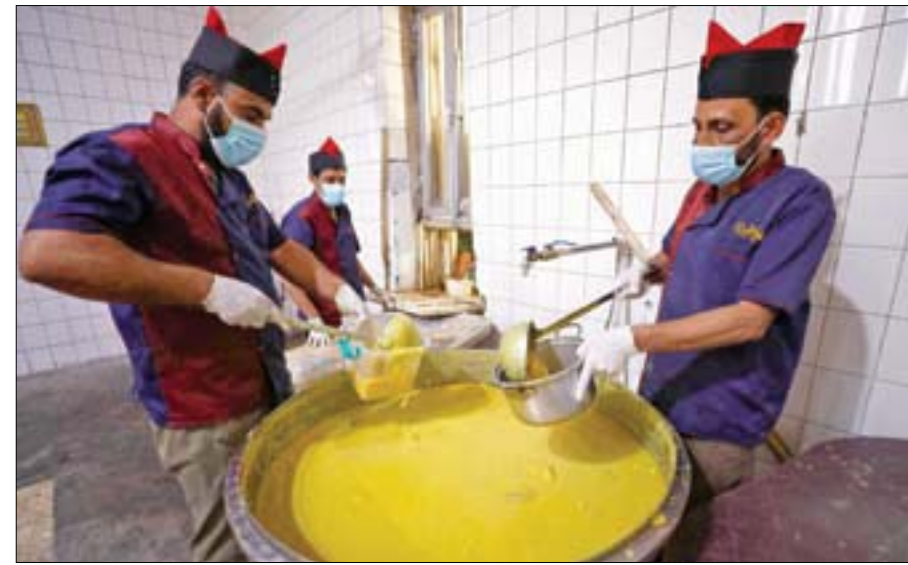
طهارة عراقيون يقدمون طعام الإفطار للمحتاجين خلال رمضان

تقريباً من 700 إلى 1000 نفر، وفي رمضان الماضي وبعد بضعة أشهر من تفشي جائحة كورونا، لم تتمكن المجموعة من تقديم وجبات الإفطار في الأماكن العامة، وكانت تقوم بإعداد طرود الطعام وتوصيلها إلى المنازل.