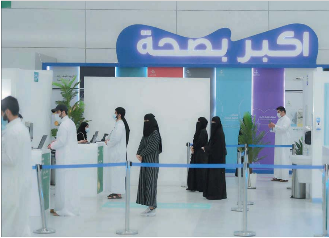
إقبال على مراكز توزيع اللقاحات في عموم مدن السعودية

وحث البيان الإنثاء على الإقبال لتلقي اللقاح. الغذاء والدواء إلى ذلك، أصدرت الهيئة العامة للغذاء والدواء، أمس، بياناً إيجابياً ببيانها الصادر بتاريخ 03 شعبان 1442هـ الموافق 16 مارس (آذار) 2021م حول بلاغات لحالات جلطات دموية أو حالات تخثر لدى المستفيدين بسبب استخدام لقاحات فيروس «كورونا»، وإشارة إلى متابعة ملف سلامة لقاحات «كورونا» كثير من الأنشطة واتخاذ العديد من الإجراءات، وقد تفيد فيه بعض المناشط وتغلق الأبواب، وتعزل الأحياء والمدن، وتوقف وسائل النقل. وتستمر السعودية في التوسع في عمليات توزيع اللقاح حيث تجاوز إعطاء اللقاح 7,3 مليون جرعة وفقاً لبيان وزارة الصحة. وشددت على ضرورة المبادرة للتسجيل في تطبيق صحي لتلقي اللقاح، موضحة أن النساء هن أكثر عرضة لفيروس كورونا حيث وصلت النسبة إلى أكثر من 55 في المائة.