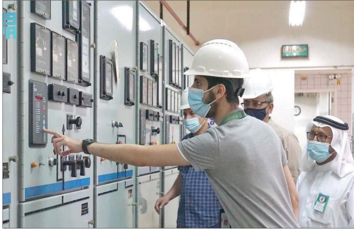
السعودية تواصل إصدار القرارات الداعمة لتوظيف المواطنين في القطاع الخاص (الشرق الأوسط)

وأكد لإسبرف، أن الحصص المخصصة تحد من الآثار المفيدة لإعانات العمالة على بطالة المواطنين، مشيراً إلى أنه يمكن لإصلاح أسعار الطاقة المحلية - حيث تستخدم أجزاء من الإيرادات المالية في إعانات العمالة - أن يؤدي إلى التقليل من بطالة المواطنين بدرجة كبيرة.