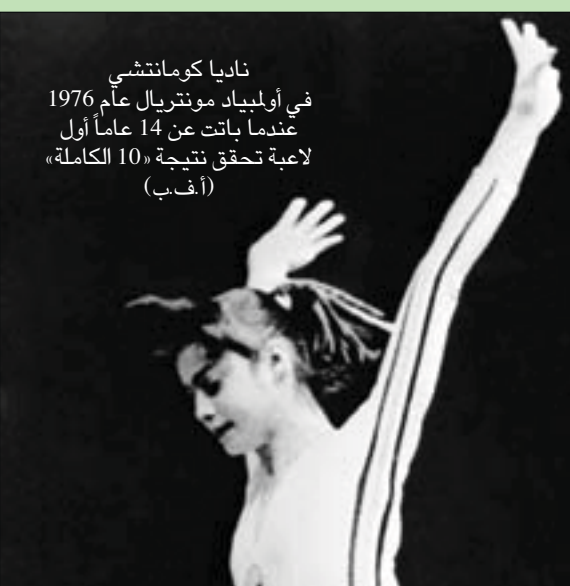
ناديا كوماننتشي في أولمبياد مونتريل عام 1976 عندما باتت عن 14 عاماً أول لاعبة تحقق نتيجة «10 الكاملة»

بشكل متكرر، كما أنها خربت من الطعام على مدى 3 أيام، والتوبيخ بسبب زيادة وزنها 300 غرام. وتقول عن كارولي في التسجيلات: «أشياء كثيرة حدثت (...) لم يعد بإمكانني النظر إليه» بعد 6 أشهر من إنجازها التاريخي في مونتريل حيث حصلت 3 ميداليات (3 ذهبيات، فضية وبرونزية)، رفضت أن تواصل التدريب بإشراف كارولي. شكت والسدة كوماننتشي من سوء المعاملة الذي تعرضت له ابنتها إلى الاتحاد المحلي للجمباز؛ حتى طلبت التحدث مباشرة مع نيكولاي وتشاوشيسكو رئيس رومانيا والأمين العام للحزب الشيوعي الروماني في تلك الحقبة.