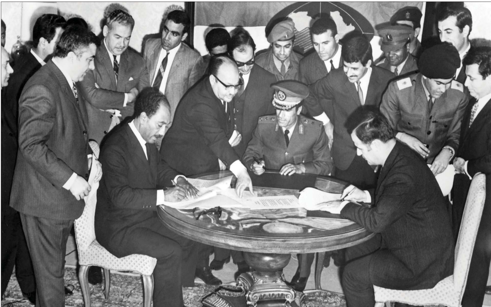
القذافي (وسط) مع الرئيس المصري أنور السادات والرئيس السوري حافظ الأسد خلال توقيع اتفاق إقامة اتحاد الجمهوريات العربية في بنغازي عام 1971

فقد فُتح الباب واسعاً أمام التحريف القذافي والعرفي في البلاد، بتقديم المغريات، ولو إلى حين. وبعد مدة قليلة، سُنَّصاف شريحة لبيبية أخرى كاملة للتجميد، عندما توجب على «الأمازيغ» اللبيبيين أن يتصرفوا الآن كعرب، بعد أن أثبت العقيد، شخصياً، في التلغزيون، انتماءهم العروبي الأصيل، بعد سرد