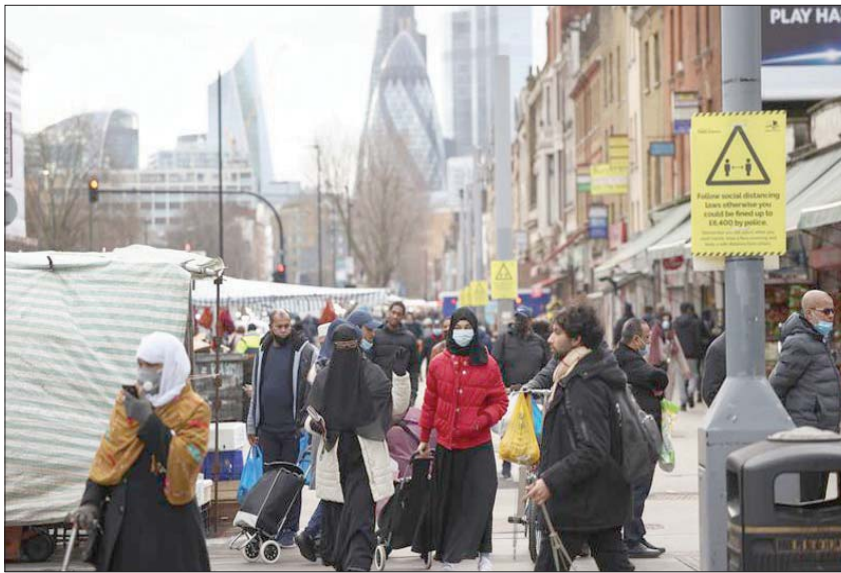
الأرقام تشير إلى ندوب ظهرت على الاقتصاد البريطاني بعد 3 جولات من إجراءات الإغلاق