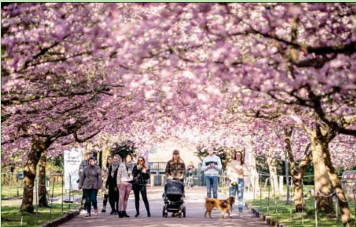
أشجار الكرز تزهر في حدائق كوبنهاغن بالنمرك معلنة قدوم الربيع الذي طال انتظاره بعد أجواء باردة في البلاد

ويمكن لبعض الأشخاص أن يشتروا نسخة أعلى ثمناً تسمى «إف إس دي (فل سيلف درايفينغ)» أو «القيادة المستقلة المتكاملة»، رغم أنها تفتقر أيضاً عدم ترك السائق مقود القيادة. وعلق رئيس «تيسلا» إيلون ماسك عبر «تويتير» الاثنين: «في هذه المرحلة، تظهر بيانات القيادة أن نظام (أوتوبايولوت) لم يكن في وضعه تشغيل، كما أن أصحاب هذه السيارة لم يشتروا نظام (إف وستند) التدابير الملأمة عندما