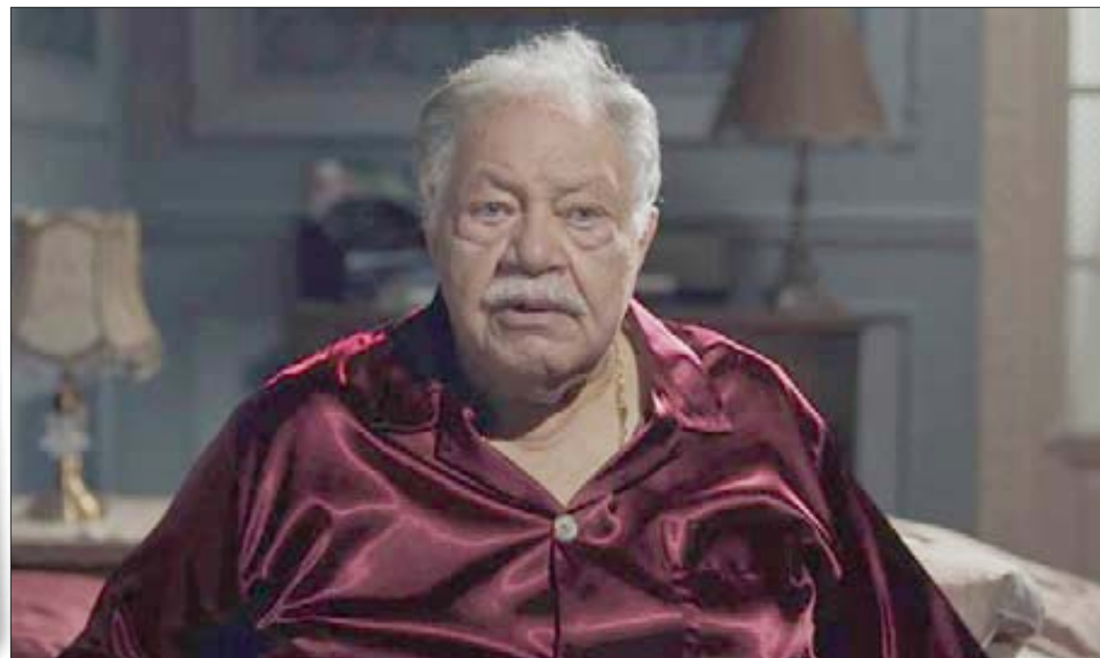
يحيى الفخراني في لقطة من المسلسل

إلى مسلسل من ثلاثين حلقة، كان أبرزها افتقاد الواقعية، فان يتخذ ثري إيطالي فتاة خلية له في بيته لمدة ثلاثين عاماً دون زواج قد يبدو مفهوماً في الثقافة الأوروبية، لكنه غير مفهوم في الثقافة الشرقية، حيث يرتكب الأثرياء نزوات مغطاة وليست معلنة على هذا