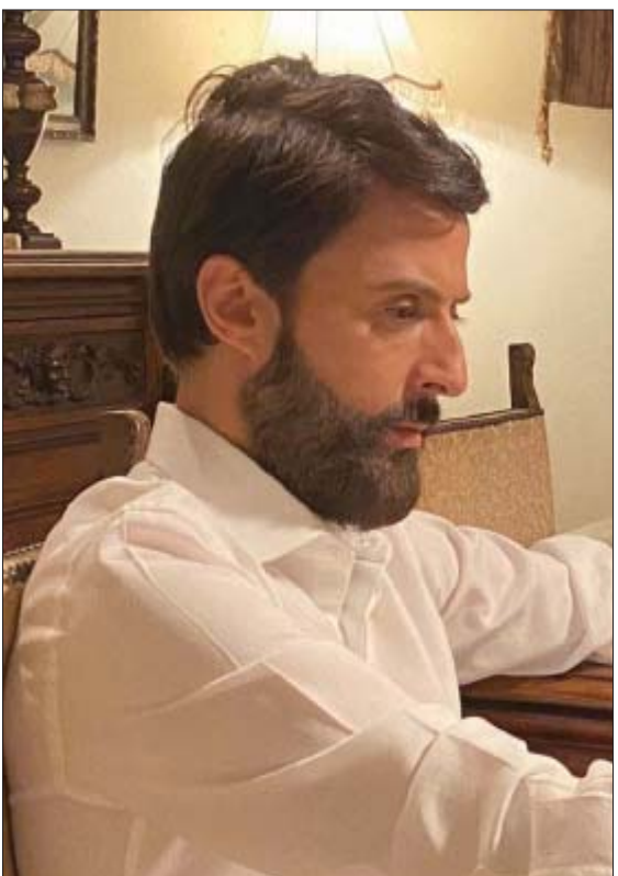
الممثل شادي حداد بطل فيلم «ع مفرق طريق»

ثواني»، أنّ جمال الطبيعة، مع إحساس تمثيلي مرهف نتج عنهما صورة متكاملة لفيلم وعادتنا الحلوة». وتتابع لارا سابا: «الجميع أعطى من قلبه ومن دون تردد وقدموا أداءً رائعاً، حتى إنّ الديكورات تعتمد على مناظر طبيعية خلابة لتكتمل رسالة الفيلم، فيكون لبنانياً بامتياز». وتؤكد المخرجة التي لديها تجربة سابقة في عالم السينما بعنوان «قصة