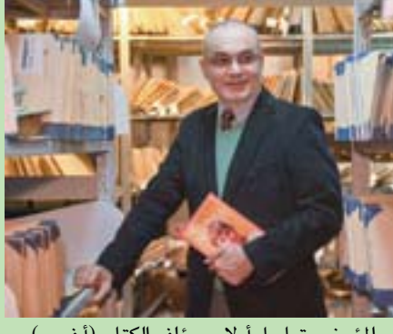
المؤرخ ستيفن ج. ج. مؤلف الكتاب (أ.ب)

بشكل متكرر، كما أنها خربت من الطعام على مدى 3 أيام، والتوبيخ بسبب زيادة وزنها 300 غرام. وتقول عن كارولي في التسجيلات: «أشياء كثيرة حدثت (...) لم يعد بإمكانني النظر إليه» بعد 6 أشهر من إنجازها التاريخي في مونتريل حيث حصلت 3 ميداليات (3 ذهبيات، فضية وبرونزية)، رفضت أن تواصل التدريب بإشراف كارولي. شكت والسدة كوماننتشي من سوء المعاملة الذي تعرضت له ابنتها إلى الاتحاد المحلي للجمباز؛ حتى طلبت التحدث مباشرة مع نيكولاي وتشاوشيسكو رئيس رومانيا والأمين العام للحزب الشيوعي الروماني في تلك الحقبة.