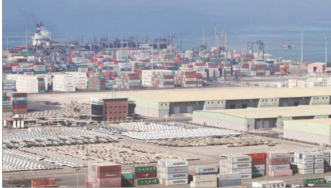
السعودية تضبط الإجراءات الاحترازية لمكافحة فيروس «كورونا» المستجد

وارتفع إجمالي أطنان البضائع 7,62 في المائة، بواقع أكثر من 24 مليون طن، والقادمة عبر 1056 سفينة بنسبة زيادة 21,38 في المائة، وذلك مقارنة بالمدة المماثلة من العام الفائت. وبحسب المؤشر الإحصائي الصادر من الهيئة العامة للموانئ، فقد حققت الموانئ السعودية خلال الشهر المنصرم ارتفاعاً لافتاً في إجمالي أعداد