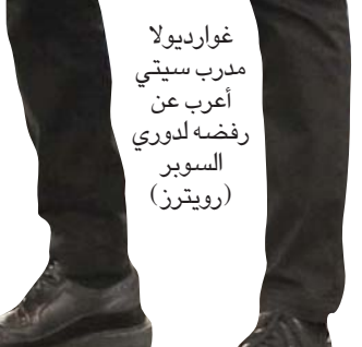
غوارديولا مدرب سيتي رفضه لدوري السوبر

ويواجه تحدياً من خلال منافسات مبنية على الريح». كما انضم رئيس الحكومة البريطانية بوريس جونسون، إلى المندوبين بالمشروع الجديد، مشيراً إلى أن حكومته «لا تستبعد اتخاذ أي إجراء» بحق الأندية المخالفة، وقال في هذا الصدد: «لن نقف مكتوفي الأيدي في الوقت التي تتطلع فيه حفنة من المالكين لخلق ناديهم الخاص». كما تضمن الإعلان الألماني لكرة القدم مع اليويفا، وطالب باستبعاد الأندية الـ12 المرتبطين بدوري السوبر الانفصالي من كل المسابقات، حتى إعادة النظر في الأمر. وقال فريترز كيلر رئيس الاتحاد الألماني، «يجب منع الأندية وقرق الشباب الخاصة بها من كل المسابقات حتى يفكروا أولاً في مشجعيهم الذين جعلوهم من أندية الصفوة في العالم، وليس فقط في أياكس ومخالف القوي». وفيما بلغ ريال مدريد ومانشستر سيتي وتشيلسي نصف نهائي دوري الأبطال لهذا الموسم، أكد بيريز رداً على تهديدات الاتحاد الإنجليزي في المستقبل، بأنه لا يحق ليفيغا أو اليويفا اتخاذ قرار بذلك، وقال لبرنامج «إل تشيرينغيتو» التلفزيوني: