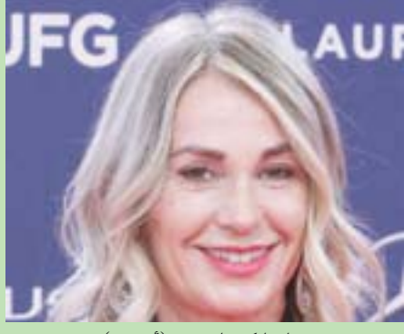
ناديا كوماننتشي