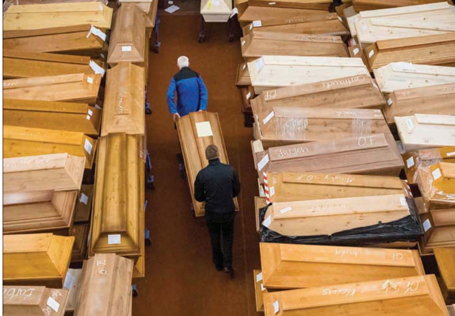
صفحة للأعمال بشأن اقتراب موعد نهاية الوباء

وتستمر وتيرة الوفيات الناتجة عن الإصابة بفيروس كورونا المستجد، بلا هوادة، رغم جهود التطعيمات العالمية، وقد صارت الدول الأكثر فقراً حول العالم تتكبد حالياً النسبة الأكبر من الوفيات بصورة متزايدة، بحسب وكالة الأنباء الألمانية. وقد أسفر فيروس كورونا الذي اكتشف للمرة الأولى في عام 2019، عن وفاة أكثر من 3 ملايين شخص، حيث تم تسجيل آخر مليون حالة وفاة أسرع من المليون حالة الأولى، بحسب ما ذكرته وكالة «بلومبرغ» للأنباء. واستغرق الأمر نحو ثمانية أشهر ونصف بعد تسجيل أول حالة وفاة في الصين حتى بلغت الوفيات المليون الأولى، ثم لم يمر سوى ثلاثة أشهر ونصف إلى أن وصل عدد الوفيات إلى 3 ملايين السبت الماضي، بحسب بيانات جامعة جونز هوبكنز، وذلك بعد مرور نحو ثلاثة أشهر فقط من تجاوز حاجز المليون الثاني في 15 من يناير (كانون الثاني) الماضي. ويشار إلى أن قصر الفترة الفاصلة بين تسجيل كل مليون حالة والأخرى، إلى جانب العدد المتزايد من الحالات الجديدة التي يتم تسجيلها في جميع أنحاء العالم، يوجه صفة لأعمال بشأن اقتراب موعد نهاية الوباء في