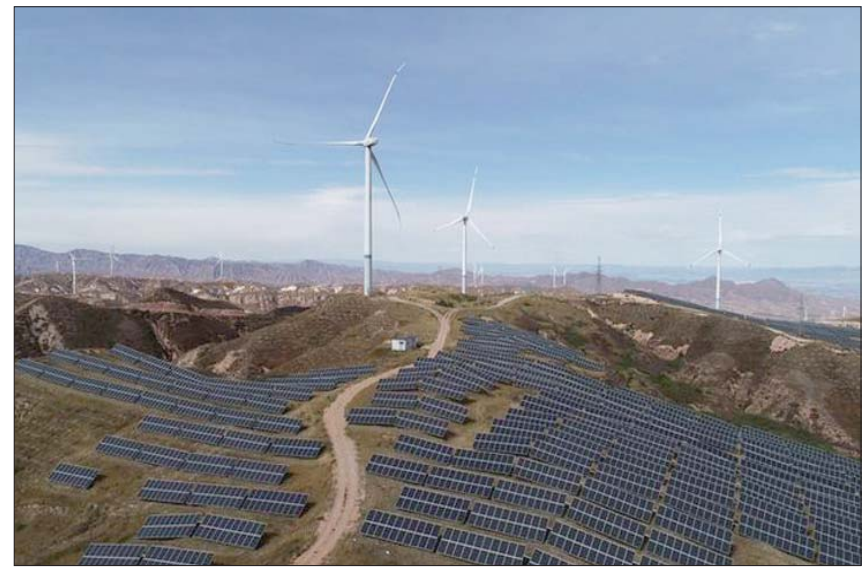
تشير التصريحات الرسمية الأمريكية إلى أن الولايات المتحدة عازمة على خوض منافسة حتمية مع الصين في نطاقات الطاقة المتجددة

فإنها «ستهدد فرصة مهمة لتشكيل مستقبل المناخ في العالم بطريقة تعكس مصالحنا وقيمنا، وستفقد عدداً لا يحصى من الوظائف للشعب الأمريكي». وأشارت الصحفية البريطانية إلى أن الرئيس بايدن، الذي أعاد الولايات المتحدة إلى قطاعي الطاقة الشمسية وطاقة الرياح كانا من بين القطاعات الأسرع نمواً في سوق الوظائف في أميركا.