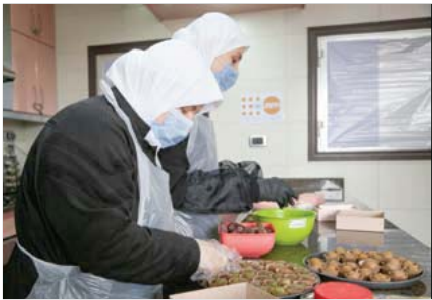
سوريات يحضرن الحلوى خلال شهر رمضان المبارك في دار للإيتام بدمشق