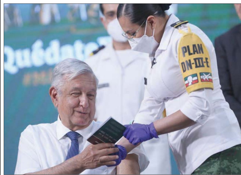
الرئيس المكسيكي أندريس مانويل لوبيز أوبرادور يتلقى لقاح «أسترازينيكا»

اعتبرت وكالة الأدوية الأوروبية أن التجلط الدموي يجب أن يدرج كآثار جانبية «نادر جداً» للقاح «جونسون آند جونسون» المضاد لفيروس كورونا الذي تبقى منافعه أكبر من مخاطره. وقالت الهيئة الأوروبية الناظمة للأدوية، في بيان، أمس (الثلاثاء)، إنها وجدت «رابطاً محتملاً» بين اللقاح والتجلط الدموي بعد ثمانية حالات في الولايات المتحدة أدت واحدة منها إلى الوفاة. وأوضحت الوكالة، ومقرها في أمستردام، أنها «تجد رابطاً محتملاً بين حالات نادرة جداً لتجلط دموي غير اعتيادي عند وجود صفائح دم متدنية»، مضيفاً أنها «تؤكد أن المنافع لا تزال تفوق المخاطر». وأشارت الهيئة الناظمة إلى أن لجنة السلامة التابعة لها «خلصت إلى أن تحذيراً حول احتمال الإصابة بتجلط دموي غير اعتيادي مع صفائح دم متدنية يجب أن يضاف إلى المعلومات حول المنتج». وخلص