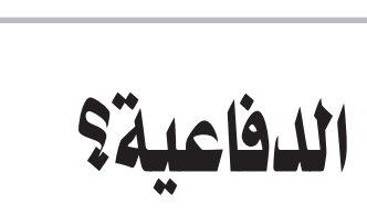
بيتر بينارت *

الصناعي العسكري الأميركي أن يحشده داخل مجالس الحكومة. ويظهر هذا التأثير بصورته الجلية داخل أروقة الكونغرس، إذ يعتمد كثير من المقاطعات على الإنفاق العسكري، حيث يشعر المشرعون بالثقل الذي يفرضه مبلغ 100 مليون دولار بصفة سنوية الذي تنفقه الصناعة الدفاعية الأميركية على حشد الأصوات وممارسة الضغط. غير أن الدولارات لا ينبغي أن تكون قدراً أو مصيراً، على مدى السنوات العشر الماضية، أضعفت مجريات المعارضة المستمرة من القبضة التي تفرصها الصناعات القوية الأخرى داخل الحزب الديمقراطي. ونتيجة لحركات «احتلال»، و«حياة السود مهمة»، وغيرها من الحملات السياسية ذات الصبغة الشعبوية التي قادها السيناتور بيرني ساندرز وإليزابيث وارين، يبدو أن الأيام التي كان بإمكان رئيس ديمقراطي للولايات المتحدة فيها أن يعين وزيراً للخزانة بسهولة من بنك غولدمان ساكس قد ولت أدراج الرياح. وعندما يتعلق الأمر بمقاولي الدفاع في الولايات المتحدة، لم تشهد وزارة الدفاع تحولاً مماثلاً. كذلك، قام الرئيس بايدن، وبالقدر المستوي