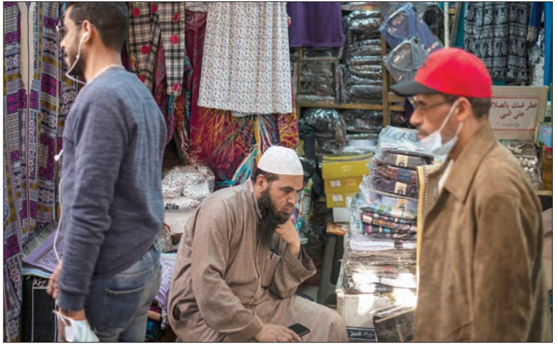
في إحدى أسواق القاهرة الشعبية في أول أيام الشهر الفضيل