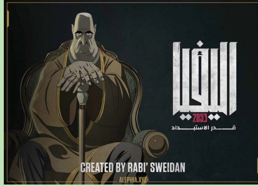
«ألفيا 2053» فيلم متحرك من توقيع لبنان