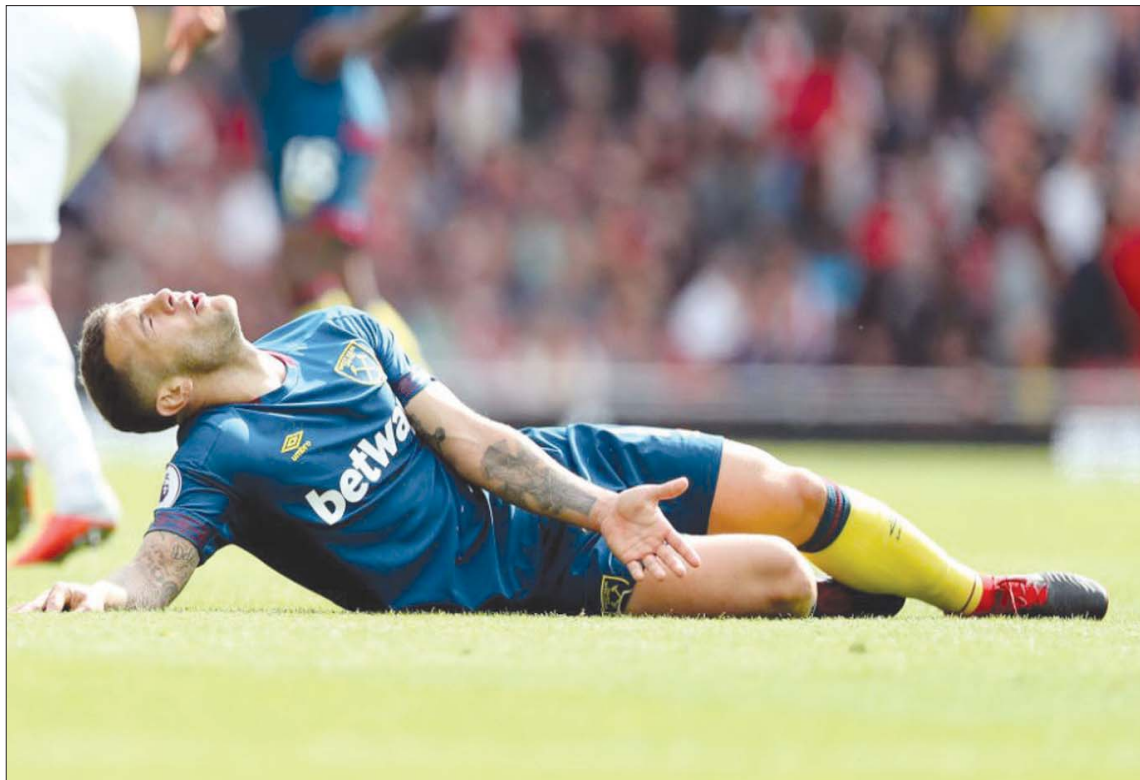
لجنة الإصابات استمرت في ضرب جاك ويلشير على مدار مسيرته

لا شك في أن جاك ويلشير يمثل حالة فريدة في كرة القدم العالمية، بسبب التحول الهيب في مسيرته الكروية، وصولاً إلى بقائه بلا فريق قبل انضمامه إلى بورنموث. صاحب الـ 29 عاماً رحل عن وستهام، بعدما خاض مباراة فقط على مدار موسم، ليبقى بلا فريق بعد رحيله عن الفريق اللندني. ووفقاً لمقطع فيديو نشرته صحيفة «العين» البريطانية، فإن لاعب الوسط الإنجليزي تدرّب خلال الفترة ما بين رحيله عن وستهام وانضمامه لبورنموث، في حديقة محلية، للحفاظ على لياقته البدنية، على أمل الانتقال إلى أي فريق بشكل مجاني.