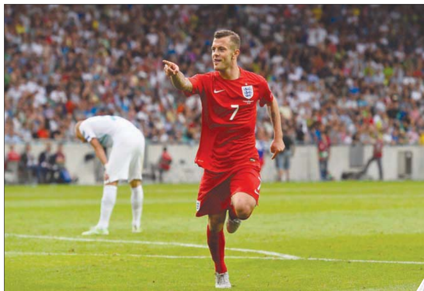
كانت آخر مباراة دولية لويلشير في نهائيات كأس الأمم الأوروبية 2016