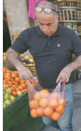
يدخل العراقيون شهر رمضان وهم يشعرون بالفزع من شدة الغلاء والبطالة

يعود ذلك بشكل رئيسي إلى ارتفاع الأسعار في عموم البلاد. فقد خفضت الدولة قيمة الدينار أواخر عام 2020، إثر انخفاض أسعار النفط الذي يشكل المورد