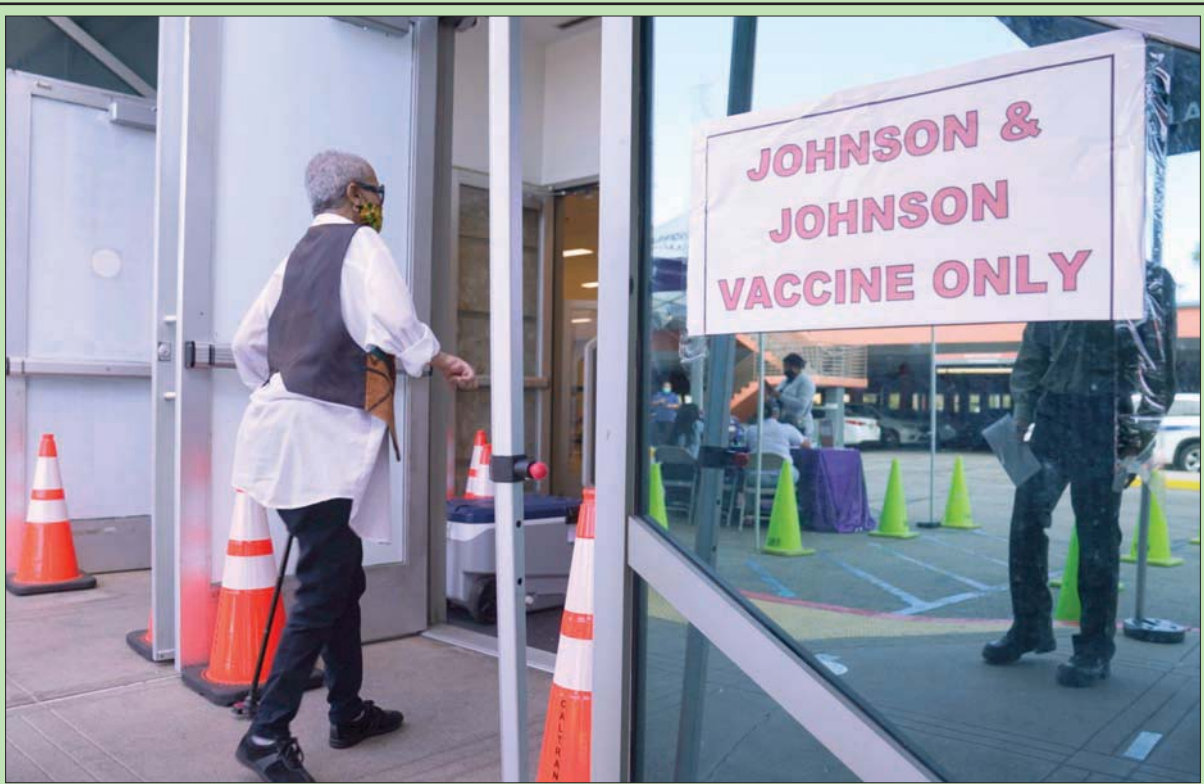
رجل يهبط بدخول مركز للتطعيم يستخدم لقاح «جونسون آند جونسون» فقط في لوس أنجلوس مطلع الشهر الحالي

المنطقة. ولفت شكري إلى أهمية دور الأمم المتحدة وأجهزتها في الإسهام نحو استئناف المفاوضات والتوصل إلى الاتفاق المنشود، وتوفير الدعم للاتحاد الأفريقي