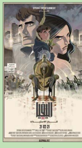
بوستر فيلم «ألفيا 2053»