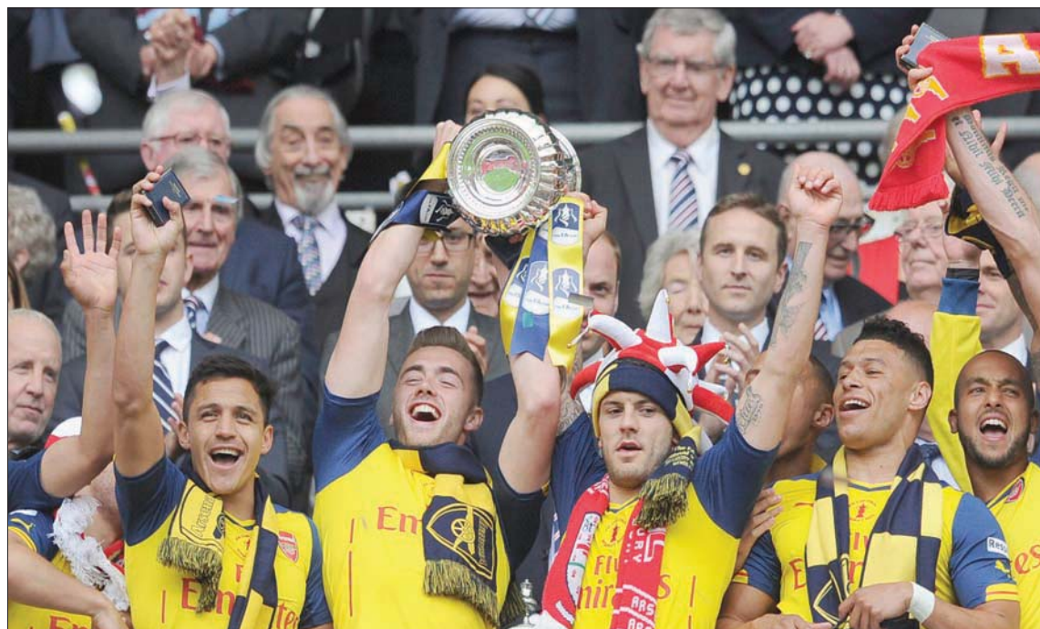
ويلشير خلال احتفال أرسنال بالفوز بكأس إنجلترا عام 2015