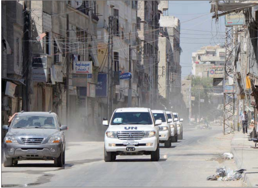
فريق أممي يزور غوطة دمشق بعد هجوم كيمائي في أغسطس 2013

تقصي الحقائق التابع لمنظمة حظر الأسلحة الكيمائية الذي له سلطة تحديد الجهة المنفذة لهجوم كيمائي. وقالت المنظمة، إن محققها استجوبوا ثلاثين شاهداً وقاموا بتحليل عينات أخذت من المكان وعابوا الأضرار التي أصيب بها الضحايا والطواقم الطبي، إضافة إلى صور التقطتها الأقمار الصناعية بهدف التوصل إلى خلاصاتهم. وأورد التقرير، أن «الأضرار» شملت حالات اختناق والتهاج في الجلد والأم في الصدر وسعال». وأبدى المحققون «أسفهم» لكون النظام السوري رفض السماح لهم بزيارة موقع الهجوم رغم طلبات متكررة. وفي وثيقة نشرت على موقع المنظمة، قال منسق لجنة تقصي الحقائق سانتياغو أوباتي، إن اللجنة «نظرت خصوصاً في فرضية أن مجموعات إرهابية مسلحة قامت بفجرة الحوادث بهدف سوق اتهامات ضد الجيش العربي السوري». وأضاف «تمت متابعة احتمالات عدة في هذا الصدد. لكن هذه الاحتمالات لم يعززها أي دليل ملموس، ولم تتمكن لجنة تقصي الحقائق من إثبات هذه الفرضيات رغم محاولات عدة». وقال الأمين العام للأمم المتحدة أنطونيو غوتيريش، إن «استخدام الأسلحة الكيمائية في أي مكان ومن قبل أي شخص وتحت أي ظرف أمر لا يمكن التسامح معه، وإفلات مستخدميه من العقاب غير مقبول بالمستوى نفسه». وأضاف «من المهم تحديد جميع هؤلاء الذين استخدموا أسلحة كيميائية ومحاسبتهم». وقال وزير الخارجية الفرنسي جان إيف لودريان، في بيان الاثنين، إن «استخدام النظام السوري لهذه الأسلحة في شكل موقف ومؤكد هو أمر مرفوض»، مشدداً على وجوب «الرد في شكل مناسب». وفي السياق نفسه، قال نظيره الألماني هايكو ماس في بيان