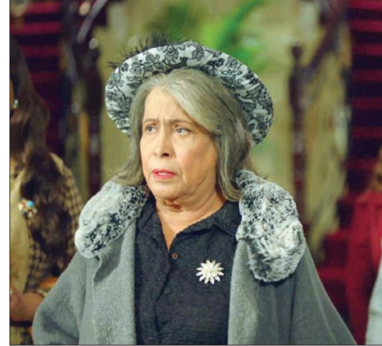
يركز «مارغريت» على التقارب بين الثقافتين العربية والبريطانية

حقيقية»، مشيرة إلى وجود الكثير من أمثال مارغريت في المجتمعات العربية. وعن جديد هذا المسلسل وما يفرضه عن غيره، تقول الفهد إن «الجديد هو لقاء ثقافتين مختلفتين كلياً، شكلاً ومضموناً، عدا القضايا الكثيرة والكبيرة التي يقدمها، وبعضها ربما يكون غريباً ولم يُطرح سابقاً». وترى الفهد في شخصية مارغريت التي أمضت جزءاً من حياتها في لندن، تعبيراً عما تصفه بـ«عشق الخليجين، خاصة الكويتيين لمدينة لندن». إلا أنّ الواضح بأنّ عودتها لم ترق للكثيرين، إذ سيطرت حالة من الكراهية والرغبة بالانقذام، على أفراد عائلة مارغريت في أولى حلقات المسلسل، وعلى ما يبدو فإن ذلك نتيجة تراكمات ستنتج للمشهد تدريجياً في الحلقات المقبلة.