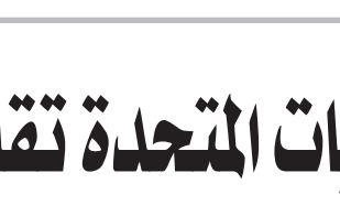
بيتر بينارت *

الاستثمار الحكومي المكافئ في قطاعات التعليم، والطاقة النظيفة، والنقل، والرعاية الصحية. كما يشهد صعود الدفاع أيضاً على أنه في غياب زيادة الإنفاق الدفاعي، حذرت إدارة الرئيس الأسبق دونالد ترمب من أن الميزانية العسكرية المتفوق العسكري الكبير. في عام 2018، حذرت إدارة الرئيس الأسبق مايك بنس من أن الميزانية العسكرية المتفوق العسكرية الكبيرة أخذت في التناقص على الصعيد العالمي، ولا سيما في ظل المساعي العسكرية