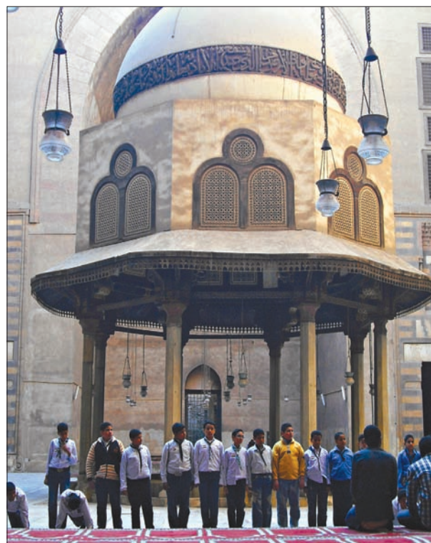
مسجد السلطان حسن من الداخل

القاهرة: «الشرق الأوسط» رغم وجود مسجدين آخرين يشبه كل منهما الآخر، في ميدان صلاح الدين، بمنطقة السيدة عائشة بالقاهرة، فإن مسجد السلطان حسن يخطف الأنظار ببنيانه العظيم وارتفاعه الشاهق وزخارفه المميزة، رغم أنه أقدم بمئات السنين عن مسجد الرفاعي المجاور. وتجذب نوافذ مسجد السلطان حسن المستطيلة والدائرية ونقوشه المميزة عين الناظرين، فيما تستقر قبته الدائرية وهيئة النون في قمة المسجد، وقد أخفى لمعانها غبار العاصمة المصرية العامرة بمئات المآذن وملايين البشر، ويوفّق مسجد ومدرسة السلطان حسن مرحلة تضوج العمارة المملوكية، إذ أنشاه السلطان الناصر حسن بن الناصر محمد بن قلاوون خلال الفترة من 757هـ - 1356م إلى 764هـ - 1363م خلال حقبة حكم المماليك البحرية لمصر. ويعتمد تصميم المسجد الذي تبلغ مساحته نحو 8 آلاف متر مربع على التخطيط المتعامد، ويتوسطه صحن مفتوح محاط بأربعة إيوانات، وتوجد في وسط الصحن نافورة تعلوها قبة بنيت على ثمانية أعمدة،