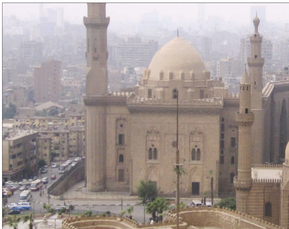
مسجد السلطان حسن بالقاهرة (الشرق الأوسط)