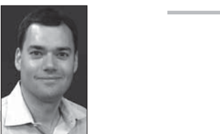
بيتر بينارت *

لا يتعلق الأمر بالجنرال أوستن فحسب. إذ عمل نائب وزير الدفاع أيضاً في مركز الدراسات الاستراتيجية والدولية، وهو عبارة عن مؤسسة بحثية، تضم من بين مموليها شركات دفاعية أميركية بارزة. من شاكلته: «نورثروب غرومان»، و«بوينغ»، و«وكهيد مارتن». وكما لاحظت السيدة ماندي سميثبيرغر من مشروع الرقابة الحكومية، فإن هناك أكثر من 10 أعضاء في إدارة الرئيس بايدن، بما في ذلك كبير مستشاري آسيا في مجلس الأمن القومي، والمسؤول عن مراجعة الاستراتيجية الصينية في وزارة الدفاع، لهم روابط سابقة بمرکز بحثي يسمى «القرن الأميركي الجديد»، وهو وفقاً لتقرير صادر عن مركز السياسات الدولية حصل على تمويل من مقاولي الدفاع في الولايات المتحدة بين عام 2014 و2019 أكثر مما حصلت عليه أي مؤسسة بحثية أخرى.