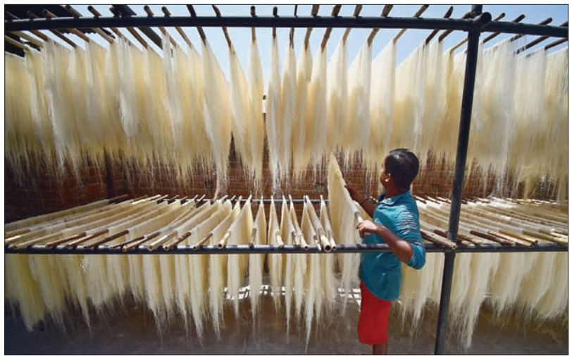
عملية إعداد الشعيرية التي تستخدم في صنع الحلويات في أحد مصانع مدينة الله آباد بالهند