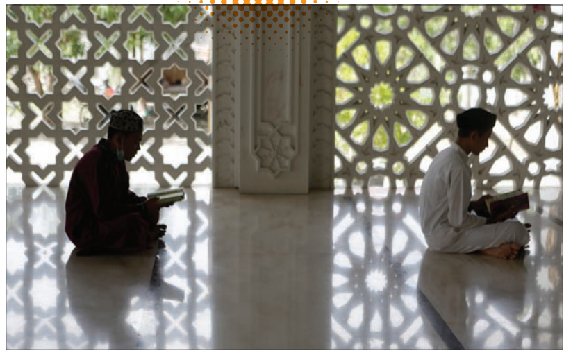
صبيان يقرآن القرآن في أحد مساجد باندا آتشييه بأندونيسيا في أول أيام رمضان