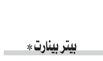
بيتر بينارت *

السروح «الرياضية» هكذا مفترضة، وذاتعة، وهي في النهاية التي تقود الجميع إلى طريق الصواب الذي يقيم قرارات سياسية واقتصادية واجتماعية صائبة. ولكن في الحياة الأميركية فإن الافتراض أمر، والواقع والحقيقة شيء آخر؛ فرغم كل شيء فقد عرفت الولايات المتحدة الأيديولوجية منذ الثورة الأميركية حتى الآن، وإن كانت حدثتها تختلف من عصر إلى آخر. وفي البداية فإن