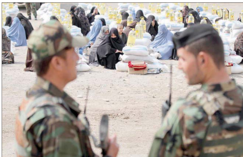
توزيع مواد غذائية على أسر قتلى جنود الحرب الأفغانية بمناسبة شهر رمضان