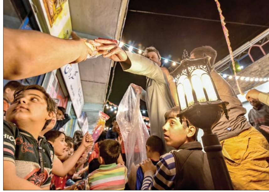
متطوعون يوزعون الألعاب على الأطفال في الليلة الأولى من شهر رمضان المبارك

ويضيف «لم نتسلم أي حصة لشهر رمضان، وهناك كثر يسألون ويتصلون هاتفياً عن الحصة التموينية لشهر رمضان».