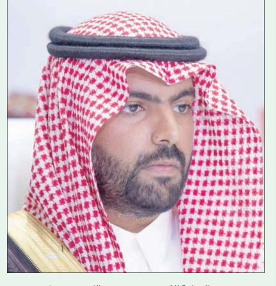
وزير الثقافة الأمير بدر بن عبد الله بن فرحان