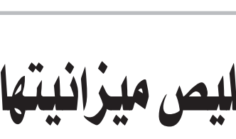
بيتر بينارت *

الولايات المتحدة على الصعيد العسكري في الصراعات الجارية بالقرب من سواحل الصين، لكن على الصعيد العالمي فإن الصين تمثل تحدياً اقتصادياً أكبر بكثير. وتحققاً لذلك، ينبغي على الولايات المتحدة أن تستثمر بصورة كبيرة في التعليم، والتكنولوجيا الناشئة، وهي الاستثمارات نفسها التي سوف يتجاوزها الإنفاق العسكري، إن عاجلاً أم آجلاً. وتتنافس القوتان العظميان على الصعيد