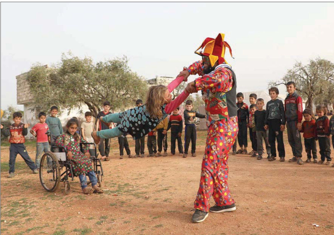
رجل يرفه عن الأطفال في مخيم كفر جالس بريف إدلب في 22 من الشهر الحالي

شمال شرقي سوريا مع مناطق الحكومة السورية، لربطها بمناطق المعارضة المسلحة، وتطبيق عملي لنتائج الاجتماع الثلاثي بين وزراء خارجية تركيا وقطر وروسيا بداية الشهر الحالي.