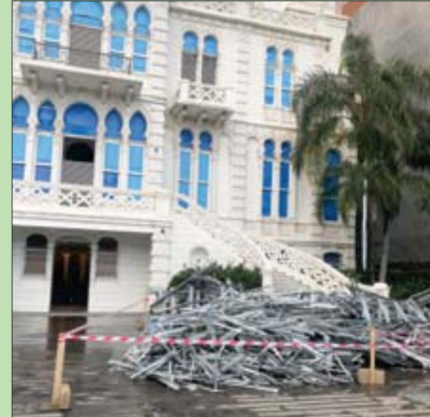
ركام خلفه انفجار بيروت في «سرسق» قد يتحول إلى نصب تذكاري

وأشارت السفيرة الفرنسية في كلمتها خلال المؤتمر إلى أن فرنسا أسهمت بعبء انفجار أغسطس في إعادة إعمار مستشفيات ومدارس ومعالم ثقافية عدة. وأن فرنسا وتكريماً منها لتاريخ لبنان الثقافي قررت القيام بهذه المبادرة. وأكدت أن هذا المشروع بمثابة تعبير عن تضامن الفرنسيين مع لبنان، شعياً ودولياً. ومما جاء في كلمتها: «هذه المساعدة تشهد على إرادة الفرنسيين العمل بشكل حسي لإعادة إحياء القطاع الثقافي من خلال تحريك جهات رسمية وشركات ومؤسسات خاصة فرنسية. كما أن المواطنين الفرنسيين أظهروا اندفاعاً في هذا الموضوع من خلال مساهمتهم السخية في كثير من