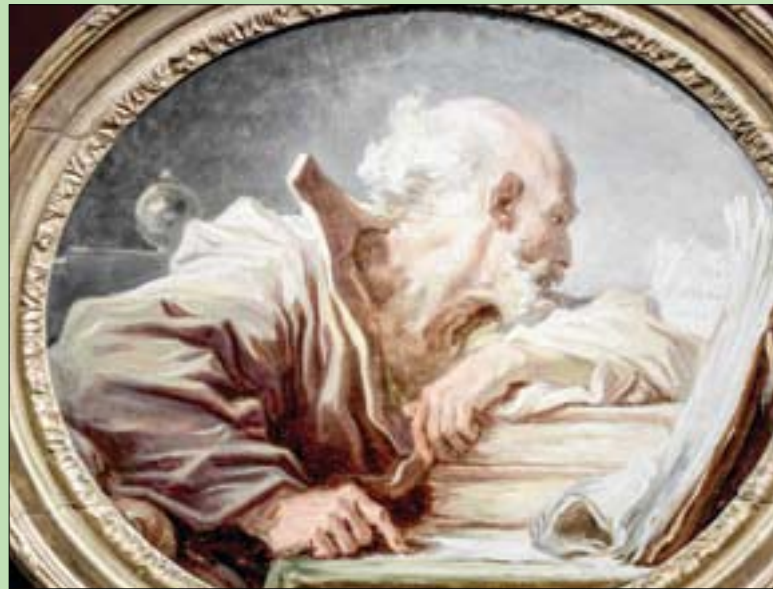
لوحة «فيلسوف يقرأ» لفنان فراغونار (أغب)

على تحرير أسلوبه لإضفاء متعة الرسم. ويعيداً عن الموضوعات الأنثوية والمتحررة التي صنعت شهرته، اختار