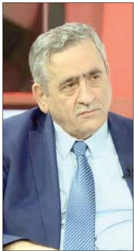
د. نذير عبيدات

للعمل، في أعقاب إلغاء وزارة الدولة لشؤون الاستثمار، وأدى اليمين الدستوري على هذا الأساس، تفاجأت الحكومة من قراءتها لاستقالة الرجل على مواقع التواصل الاجتماعي. يومها، قالت الحكومة إن الرئيس الخصاونة عرض على الوزير ثلاثة خيارات، بعدما سارعت في خطوة غير مسبوقة، إلى إصدار توضيح على لسان وزير الدولة لشؤون الإعلام الجديد صخر دودين. وجاء فيه أن استقالة القطامين جاءت رغم عقد اجتماع بينه وبين الخصاونة لمناقشة حقيقتي التعديل، وأن رئيس الوزراء أبلغه بأن الجمع بين حقيقتي الاستثمار والعمل ثبت عدم جدواه خلال الأشهر الماضية، وأنه سيصار إلى فصل الحقيقتين. ووضع رئيس الحكومة، وفقاً لبيانها في ذلك اليوم، 3 خيارات أمام الوزير المستقيل، هي: الاستمرار في تولى حقيبة العمل، أو الانتقال إلى رئاسة هيئة تشجيع الاستثمار، أو المضي قدماً في إجراءات استقالته التي طلبت من الطاقم الوزاري قبل التعديل، لافتاً بقوله بالاستمرار بوزارة العمل وأدائه اليمين القانونية. ويعكس ما كان القطامين