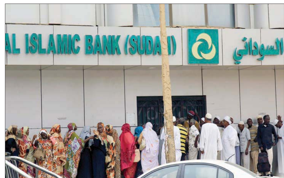
أكدت وزارة الخزنة الأميركية الجمعة أن السودان سوّى ديونه لدى البنك الدولي

واشنطن، «الشرق الأوسط» - وهناك قضية مثارة أخرى تتعلق بكمية المياه التي سيستهلكها مصنع الجديد في صناعة السيارات الكهربائية، وأيضاً مصنع البطاريات التابع له. وكان أندريه بيلر، رئيس جمعية المياه قبل أسبوعين - «شتراسبرغ - أركنر»، قد قال في البرنامج قبل أكثر من أسبوع - «تمت الضخمة بكميات المياه على طاولة هدايا السياسة الاقتصادية». وفي المقابل، تنفي الشركة أن حركة الإنتاج في مصنعها ستؤدي إلى قيود على مياه الشرب واستندت في ذلك إلى تقارير خبراء. ونفى ماسك بشكل شخصي أي مشكلات محتملة تتعلق بالمياه، وقال: «نحن بالأساس لسنا في إقليم جاف للغاية وما كان للأشجار أن تنمو لو لم تكن هناك مياه، واعني أننا هنا لسنا في الصحراء». تجدر الإشارة إلى أن «تسلا» كانت قد قدرت كمية المياه التي يمكن أن يستخدمها مصنع في حال استنفاده أقصى طاقته الإنتاجية (500 ألف سيارة) بنحو 1,4 مليون متر مكعب سنوياً، على أقصى تقدير، وذلك قبل تخفيض الكمية بنسبة 30% من خلال تدابير لترشيد الاستهلاك. وقالت الشركة إن هذا هو الحد الأقصى المقرر للحاجة من المياه في أشد الظروف غير المواتية. ولفتت «تسلا» إلى أن كمية الاستهلاك يمكن أن تكون أدنى بصورة ملحوظة في ظل ظروف التشغيل المعتادة. وكان ماسك قد غرّد على «تويتر» قبل توجيه دعوة للمقابلة إليه، قائلاً: «مدهش... عار عليك يا (زد دي إف إنفو)»، وأشار إلى مدونة انتقدت تغطية إخبارية للقناة شابقتها أخطاء مزعومة.