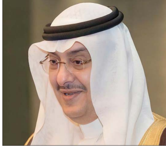
الأمير خالد بن فهد

ومنذ تأسيسه في أكتوبر 1955، تعاقب على النادي 14 رئيساً، آخرهم صوفان السويكت، أمضوا 19 مرة، مع مرتين لكل من الأمير سلطان بن سعود والأمير فيصل بن عبد الرحمن. سيتم فحص وإعلان القائمة الأولية للمرشحين والناخبين خلال يومي السبت