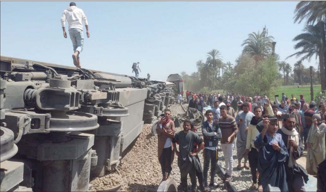
مصريون في موقع حادث تصادم القطارين بمركز طهطا بمحافظة سوهاج جنوب البلاد أسس

بهم كدعم طبي من المركز القومي لنقل الدم بمحافظة القاهرة إلى بنك الدم الإقليمي بسوهاج، وكذلك توافر مخزون الأدوية والمستلزمات الطبية بجميع المستشفيات»، وتوجه النائب العام المصري، المستشار حمادة الصاوي، إلى موقع حادث القطارين أسس لمعاينته، وكان النائب العام قد أمر بالتحقيق العاجل في الحادث، وانتقل فريق من محقق النيابة العامة إلى مكان الحادث أواخر الشهر الماضي، ووصل البرلمان المصري على خط الحادث، مؤكداً عزمه على «محاكمة جميع المسؤولين عن وقوع الكارثة»: إذ قال النائب عبد قرقم، وكيل لجنة النقل والمواصلات بمجلس النواب (البرلمان)، إن «اللجنة تنتظر كافة التفاصيل من الحكومة بشأن الحادث، لتقوم بدورها في مناقشة المالبسات بناءً على المعلومات الرسمية»، وتوقفت جميع القطارات جريباً إلى الصعيد سوهاج واسيوط والأقصر وقنا. في حين أكد مساعد وزيرة الصحة والسكان للإعلام والتوعية، خالد المتحدث الرسمي للوزارة، خالد مجاهد، «عدم صحة المعلومات المتداولة وعدد وسائل الإعلام ومواقع التواصل الاجتماعي بمناسبة وزيرة الصحة للمواطنين بالتبرع بالدم لمصابي الحادث»، موضحا «توافر 1034 كيس دم من مختلف الفصائل، و3467 كيس بلازما بنك الدم الإقليمي بسوهاج، بالإضافة إلى 3000 كيس دم مخزون استراتيجي، تم الدفع