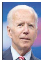
الرئيس الأمريكي جو بايدن

«لقد انتخبنا لحل المشكلات وليس لخلق الانقسامات... وقلت سابقاً إن أكثر القضايا إلحاحاً بالنسبة إلى الشعب الأمريكي هي (كوفيد - 19) والأزمة الاقتصادية التي تؤثر على ملايين الأميركيين. وهذا هو سبب تركيزي في البداية على هذه المشكلات تحديدًا... وستكون قد أعلنتنا 200 مليون جرعة (لقاح ضد الفيروس) بحلول اليوم المائة من ولايتي».