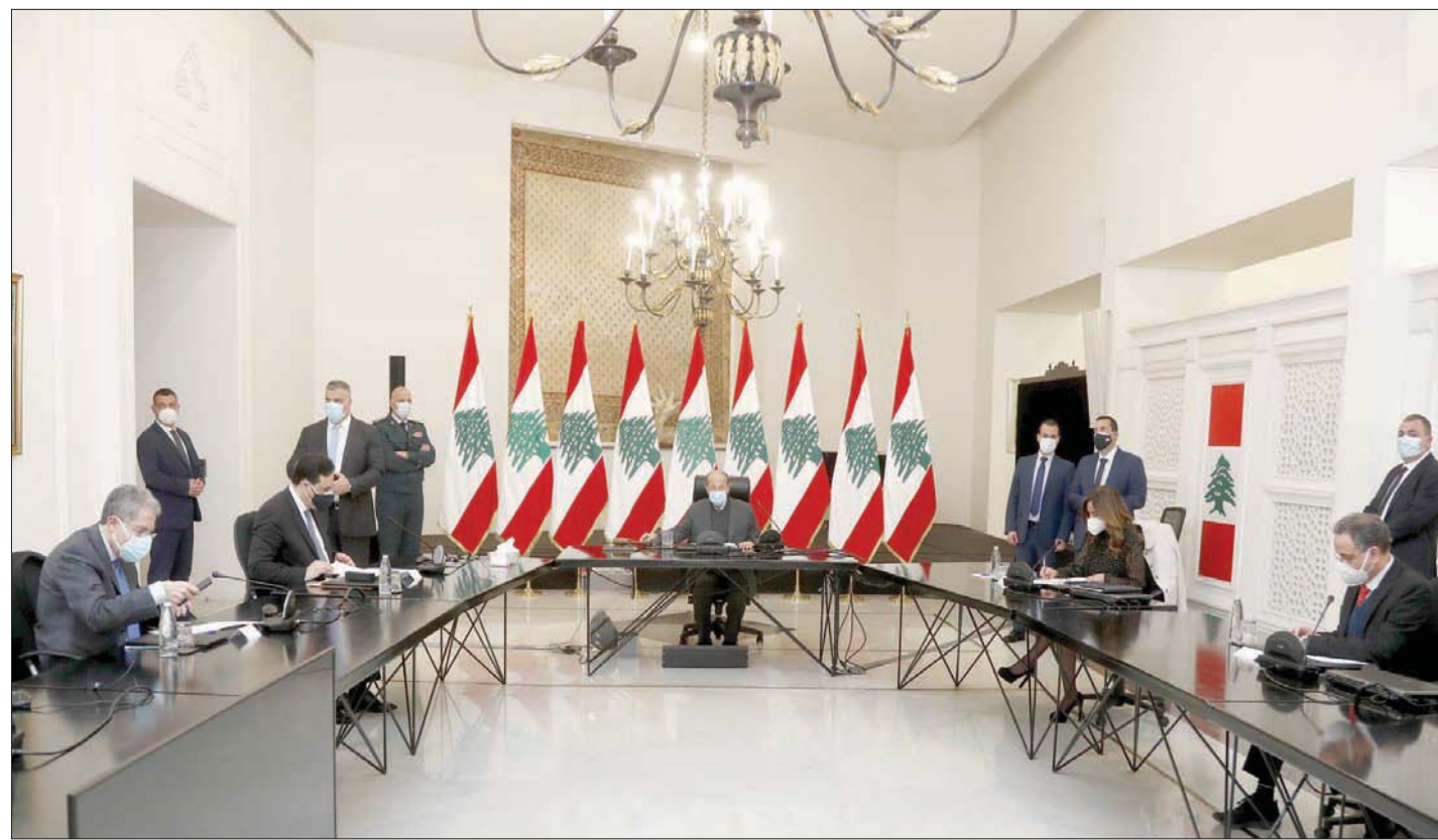
من اجتماع «المجلس الأعلى للدفاع» أمس برئاسة الرئيس ميشال عون (اللاتي ونهرا)

منها من جودة جيدة، أي يمكن استثمارها في إطار البحوث، ولا نقصد أنها خطرة أو ما شابه». وتضمن هذا الملف إلى ملف الغفايات المشعة والمواد السامة في مستوعبات متناهكة في مرفأ بيروت، وتطرق إليها دياب في مداخلة ضمن المجلس الأعلى للدفاع، مشيراً إلى أن المستوعبات يُفترض أن يبدأ ترحيلها خلال أيام، بعد أن انطلقت البادرة التي أدخلت في الخمسينات، حين كانت المنشأة بإدارة الشركة الأميركية Medico حين كان في المنشأة مصفاة للنظف وقبل إصدار معاهدة حظر انتشار الأسلحة النووية. وأوضح مدير الهيئة الوطنية للطاقة الذرية بلال نصولي، أن «اصلاح البورانيوم المنضخ هي مواد استهلاكية يتم استخدامها في الأبحاث العلمية»، مشدداً على أنها «غير قابلة للانفجار أو الاشتعال». وفي تفسير لوضوحها ب«عالية النقاوة»، قال «نقص في السوق السوداء، ولا سيما أن وزنه قد يصل إلى 100 كغ». وكانت «الدولية للمعلومات» أشارت انطلاقاً من أرقام المديرية العام لقوى الأمن إلى ارتفاع نسب السرقة والقتل منذ بداية العام الحالي، إذ شهد لبنان خلال شهري يناير (كانون الثاني) وفبراير (شباط) الماضيين ارتفاعاً في جرائم السرقة بنسبة 144 في المائة مقارنة بالفترة ذاتها من العام الماضي، في حين سجلت جرائم القتل ارتفاعاً بنسبة 45,5 في المائة. وتبلغت نسبة الجرائم بالقتل في جرائم السرقة، في هذا النوع من السرقات، فعلى سبيل المثال كادت سرقة دعوات عمود كهربائي لا يتجاوز سعرها ربما 20 دولاراً، خسائر كبيرة لشركة الكهرباء وتسبب في انقطاع الكهرباء عن منطقة كاملة. وكانت مؤسسة كهرباء لبنان أعلنت منذ أيام تعطيل خط النقل الكهربائي الرئيسي في مدينة