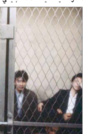
من فيلمه البوليسي L.667

لم يكن «رحلتي عبر السينما الفرنسية» فيلمه التسجيلي