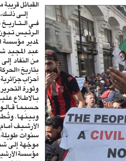
مشاركون في الحراك بالعاصمة الجزائرية أمس

القبائل قريبة من لا شيء. إلى ذلك، طالب باحثون في التاريخ في رسالة إلى الرئيس عبد المجيد شحبي، لتكثيفهم من النضال إلى الوثائق الخاصة بتاريخ «الحركة الوطنية» نشاط أحزاب جزائرية وقت الاستعمار، وثورة التحرير، المسموح قانوناً بالاطلاع عليها. لكن شحبي، حسبما قالوا، تحول بينهم وبينها. وطرح «أزمة إغلاق الأرشيف أمام الباحثين»، منذ سنوات طويلة، وأصاب الاتهام موجة إلى شحبي الذي يراس مؤسسة الأرشيف منذ زمن بعيد، وهو منذ فترة قصيرة مستشار للرئيس «مكلف بقضايا الأذرة، ومن الأسماء البارزة التي تضمنت رسالة الباحثين، دحو جربال المقيم في فرنسا، ومحمد القوروصو وعامر محمد عمران. ومما جاء فيها: «رغم العناية