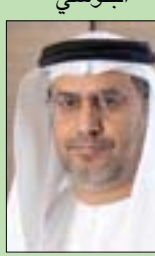
مطر حامد النيايدي

• السفير مطر حامد النيايدي، سفيراً لدولة الإمارات العربية المتحدة لدى الكويت إلى وزير خارجية دولة الكويت، أحمد ناصر الحمد الصباح، ونقل السفير، خلال اللقاء، تحيات عبد الله بن زايد آل نهيان، وزير الخارجية والتعاون الدولي، وتمنياته لحكومة وشعب الكويت مزيداً من التقدم والأزدهار في المجالات كافة. وأكد السفير الإماراتي بذل الجهود كافة لتوسيع آفاق التعاون في جميع المجالات، بما يحقق مصالح وطموحات البلدين والشعبين الشقيقين.