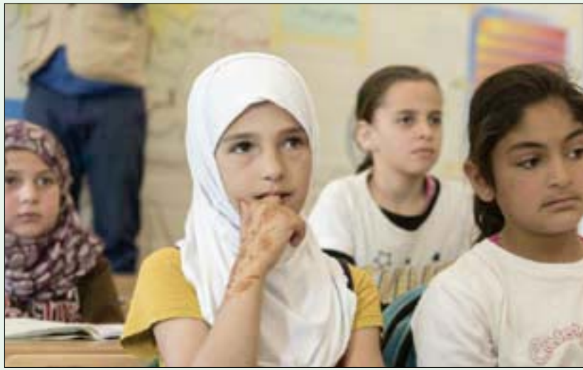
الجانحة أثرت على تلاميذ المدارس في جميع أنحاء العالم

دروس تعويضية وخطط استدرابية للحاق بالركب. لكن تفيد بيانات جديدة وردت في دراسة استقصائية أجريت بالتعاون بين «اليونيسكو» و«اليونيسف» بأن ربع عدد الطلاب فقط يستفيدون من مثل هذا التعليم التعويضي. وفي حين أنه لم يطرأ تغيير كبير على عدد المتعلمين المتأثرين بالإغلاقات الجزئية أو الكلية التي اجتاحت المدارس منذ نشي الجائحة، تتخذ البلدان بصورة متزايدة تدابير كفيّة الإبقاء على المدارس مفتوحة بشكل جزئي على الأقل. فالمدارس مفتوحة بالكامل في قرابة نصف عدد بلدان العالم فقط (أي في 107 بلدان)، معظمها في أفريقيا وآسيا وأوروبا، وبرتادها 400 مليون تلميذ وطالب، موزعين بين مرحلتى التعليم قبل الابتدائي والتعليم الثانوي. ولا تزال المدارس مغلقة في 30 بلداً، الأمر الذي يؤثر في قرابة 165 مليون طالب. وفي 70 بلداً آخر، لا تزال المدارس مغلقة على نحو جزئي في بعض المناطق، ولصوف محددة، أو يقل فيها الحضور الشخصي. وتؤثر هذه الظروف في ثلثي عدد الطلاب في العالم؛ أي ما يقرب من مليار متعلم. ولا بد للتخفيف من الانقطاع عن الدراسة أن تولي مسيرته التعافي الأولوية للتعليم.