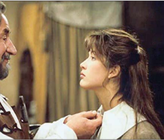
صوفي مرسو وفيليب نواريه في «ابنة دارتانيان»