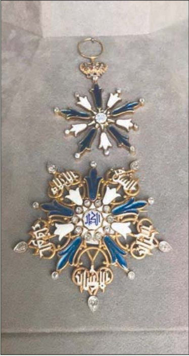
نيشان الكمال لإحدى أميرات الأسرة العلوية (الشرق الأوسط)

ومبلغاً من المال، بالإضافة إلى كسوتها الشتاء والصيف، ويعرض المتحف منبر المدرسة، وهو من الخشب المطعم بالعاج، ويتكون من ريشتين وباب يفتح على درج سلم يعلوه الضوء على بعض الكونز النسائية والمقتنيات التراثية المتعلقة بهن، التي تُخلد دور النساء في مجالات الحياة المصرية المختلفة، وعلى الرغم من الغناء الأنشطة الثقافية والفنية بالمتاحف ضمن الإجراءات الاحترازية لمواجهة انتشار «كوفيد - 19»، وتروي هذه الكونز قصص صاحباتها من الملكات والأميرات والخادما أحياناً.