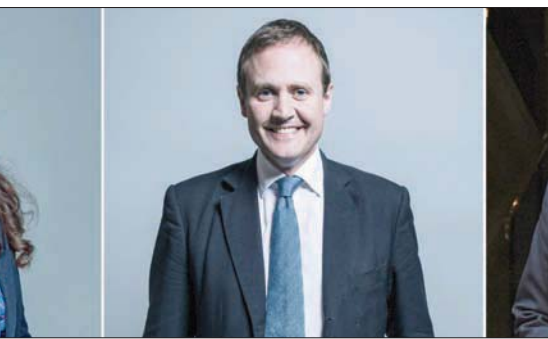
في قائمة العقوبات الصينية: آلن دنكان سميث (يمين) توم تونغندها (وسط) ونصرت غني

والتشليل، وينتهك بشكل صارخ القانون الدولي والأعراف الأساسية التي تحكم العلاقات الدولية، ويتدخل بشكل صارخ في الشؤون الداخلية للصين، ويقوض بشدة العلاقات الصينية البريطانية». وأضافت أنها استدعت السفير البريطاني لدى الصين «لتقديم احتجاجات رسمية والإعراب عن الرضا والشديد والإدانة القوية». ورد وزير