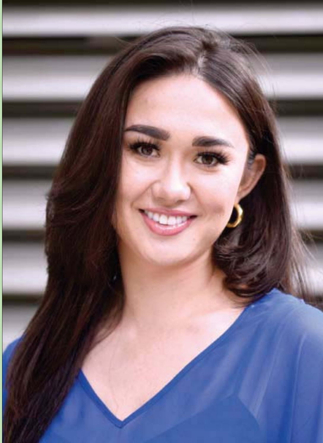
المثلة الأميركية كيمبرلي ألكسيس بي تحضر العرض الأول للمسلسل الكوميدي الثقافي الحديث «عائلتي» في بيفرلي هيلز بولاية كاليفورنيا

وإنني من منبري المتواضع هذا أهنئ (هنا على الجهاد) مشجعاً ومحرضاً الفصائل المتناحرة والمقاتلة بينها في سوريا، ومعها أيضاً جنود (حزب الله) في لبنان، واليكم (بالزغليل) الإسرائيليّات (تربت إيمانكم)، وأنا من خلفكم أدمكم بالدعاء والتطليل.