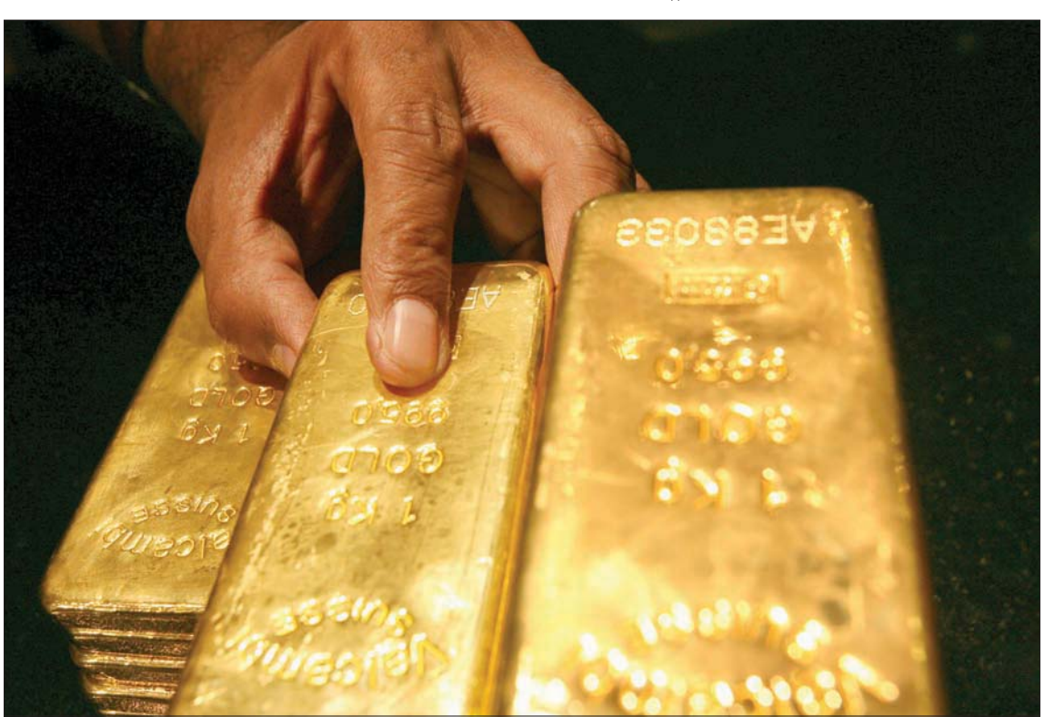
سجل الدولار أعلى مستوى في عدة أشهر خلال تداولات الجمعة دافعاً الذهب للتراجع (رويترز)

وقال سلة من ست عملات رئيسية 92,769 قرب أعلى مستوى في أربعة أشهر. وفي الأسبوع، يتجه مؤشر الدولار صوب تحقيق مكسب 0,9%. وسيفحص المتعاملون بيانات الأسابيع القليلة الفاتحة كانت في الولايات المتحدة من المقرر صدورها، بحثاً عن أي تلميحات بشأن مقابلة الاقتصاد الأميركي. وعوض اللوزان الإسترالي والنيوزيلندي خسائر حادة تكبدتها في وقت سابق من الأسبوع. وقال محللون إن العطلتين ستظلان مدعومتين على الأرجح بسبب نجاحات النسبي في الحد من التداعيات الاقتصادية الناجمة عن جائحة فيروس «كورونا».