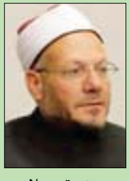
د. شوقي علام

• الدكتور شوقي علام، مفتي الديار المصرية رئيس الأمانة العامة لظور وهيئات الإفتاء في العالم، استقبل أول من أمس سفير كندا في القاهرة، لويس دوما، لبحث أوجه تعزيز التعاون الإفتائي بين دار الإفتاء الكندي مهام منصبه. وأكد المفتي على عراقية دار الإفتاء التاريخية، بصفتها المؤسسة الأهم في مجال الفتاوى ومعالجتها، وكونها أول مؤسسة دينية تغزو الفضاء الإلكتروني لنشر صحيح الدين ومواجهة الفكر المتطرف، فيما أثنى السفير على الدور الذي تقوم به الدار لمواجهة التطرف.