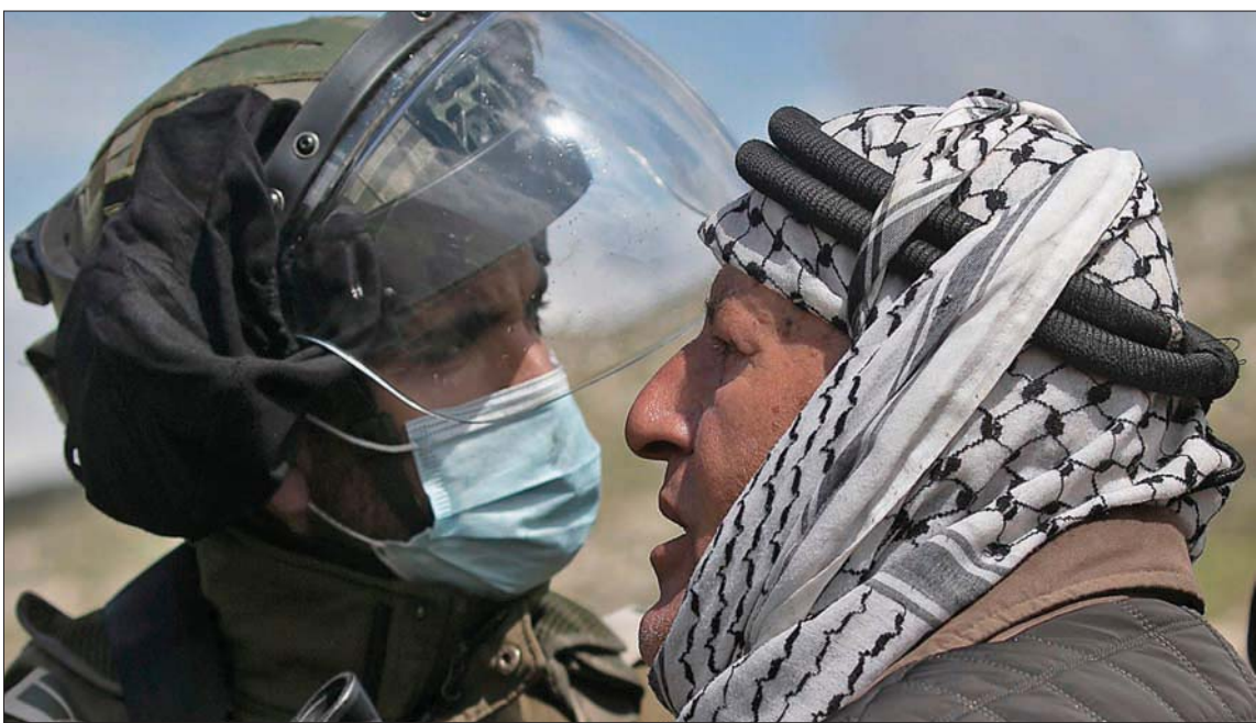
احتجاجات فلسطينية في بيت جن شرق نابلس بالضفة الغربية المحتلة أمس

كما أصيب ثلاثة مواطنين بالرصاص المعدني المغلف بالمطاط، والعشرات بالاختناق بالغاز المسيل للدموع، خلال قمع قوات الاحتلال مسيرة بيت دجن شرق نابلس. وأفاد شهود عيان بأن مسيرة بيت دجن انطلقت من أمام المسجد الكبير في القرية، حيث توقف المشاركون أمام منزل الشهيد عاطف حنايشة الذي استشهد قبل أسبوع برصاص الاحتلال، ثم توجهت إلى منطقة الشفاء في الأراضي المحتلة بالاستيلاء عليها، حيث هاجمت قوات الاحتلال المشاركين في