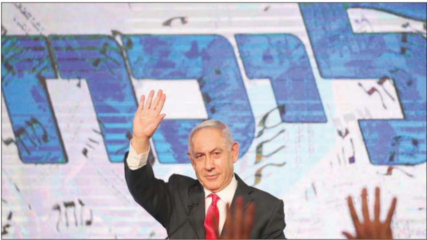
نتنياهو يشعر بالعجز عن تشكيل حكومة بعد نتائج الانتخابات الأخيرة

بهذه الطريقة حزب «يميننا»، و«كروا» أن يبيد بفضل العمل بضممت وهذوء ولا يرتكب أي خطأ حتى لا يخسر الفرصة التاريخية لإسقاط نتنياهو. وقال رئيس أحد الأحزاب في هذا المعسكر: «لم ننجح بعد في وضع خطة تسمح بتشكيل حكومة تغيير، لكن النتائج التي حققناها واضحة وتمنحنا فرصة لجديد. وسنغفل ذلك بالتأكيد».