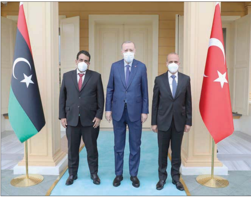
صورة وزعتها الرئاسة التركية للرئيس رجب طيب إردوغان متوسطاً رئيس المجلس الرئاسي الليبي محمد المنفي (يسار) وعضو المجلس عبد الله حسين اللافي (وسط) وإبراهيم كاليين وزير الخارجية التركي (يمين) في إسطنبول أمس (الجمعة)، بالتعاون مع تركيا.

أفترقة: سعيد عبد الرازق القاهرة، خالد محمود