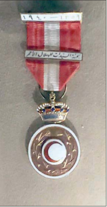
نيشان الهلال الأحمر الخاص بالملكة نازلي (الشرق الأوسط)