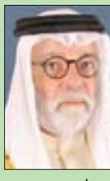
د. ناصر محمد البلوشي

• الدكتور ناصر محمد البلوشي، سفير مملكة البحرين لدى الجمهورية الإيطالية، اجتمع أول من أمس مع وكيل وزارة الخارجية والتعاون الدولي الإيطالية، بينيديتو ديلا فيدوفا، حيث استعرضا العلاقات الثنائية الوطيدة بين البلدين الصديقين، وسبل تطويرها، مع تأكيد أهمية المشاركات الإقليمية في المنتدى العالمية، كمندوب حوار المنامة وحوار البحر المتوسط، لما تحظى به من أهمية بالغة في رسم المنطقة. كما بحثا عدداً من الموضوعات والقضايا ذات الاهتمام المشترك على الساحتين الإقليمية والدولية.