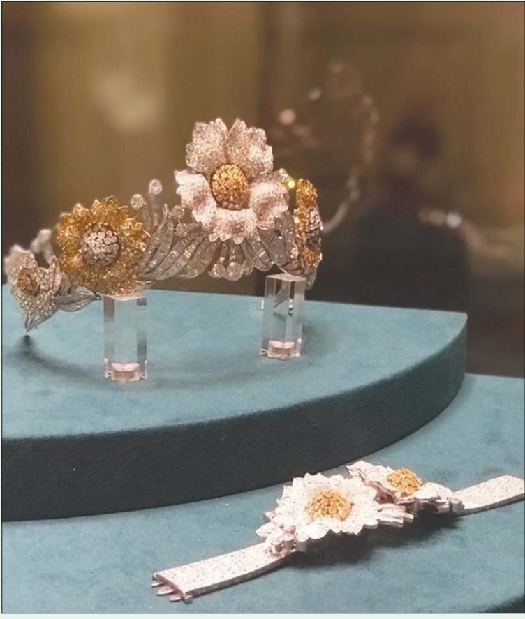
تاج الملكة فريدة من مقتنيات متحف الجواهر الملكية (الشرق الأوسط)