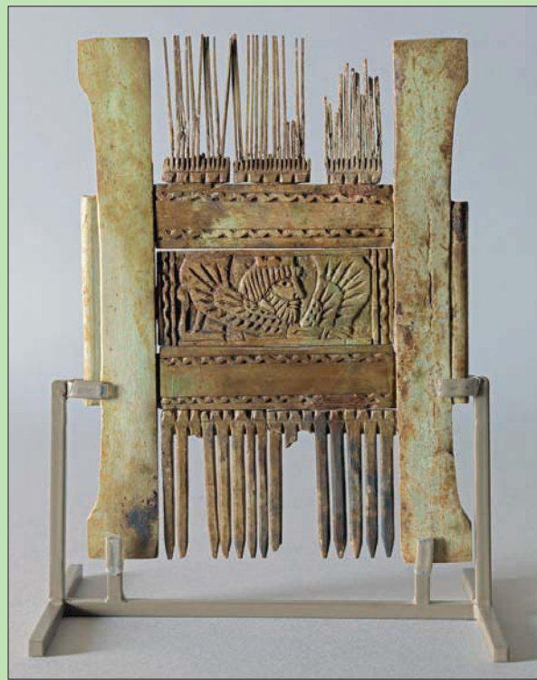
مشط شعر عاجي تم اكتشافه في أحد النواويس المجسمة في منطقة صيدا

دون تفريق. وتقول في حديث لـ«الشرق الأوسط»: «كانت هناك صعوبة في اختيار القطع التي يحكي عنها الدليل. فكل قلعة منها تحكي قصة وترمز إلى أسطورة أو حكاية يستمتع قارئ الدليل في التعرف إليها. ولكني رغبت في تسليط الضوء على التنوع الذي يسود تاريخ هذه القطع واكتشافها من نواح عديدة. فهذا التنوع يشمل عملية توثيق لتشكيلة مميزة تحكي عن التسلسل الزمني لتاريخ لبنان. كما يلقي الضوء على ثراء مناطق لبنانية مختلفة في موضوع الآثار». وعن سبب اختيار صورة النواويس لغلاف الدليل تقول: «هذا الخيار يعود إلى الإيطاليين الذين وجدوا فيها اختصاراً وعنواناً لمرحلة إتمام مشروع إعادة تأهيل الطابق السفلي من المتحف. وقد رصد له مبلغ مليون و20 ألف يورو وأرادوا أن يصدرها منشوراً عن تجديد هذا الطابق. فارتأيت أن نصدر هذا الدليل بدلاً عن المنشور المرتقب فيكون شاملاً مختلف طوابق المتحف من دون استثناء». قلة من اللبنانيين تعرف بمناطق أثرية لبنانية