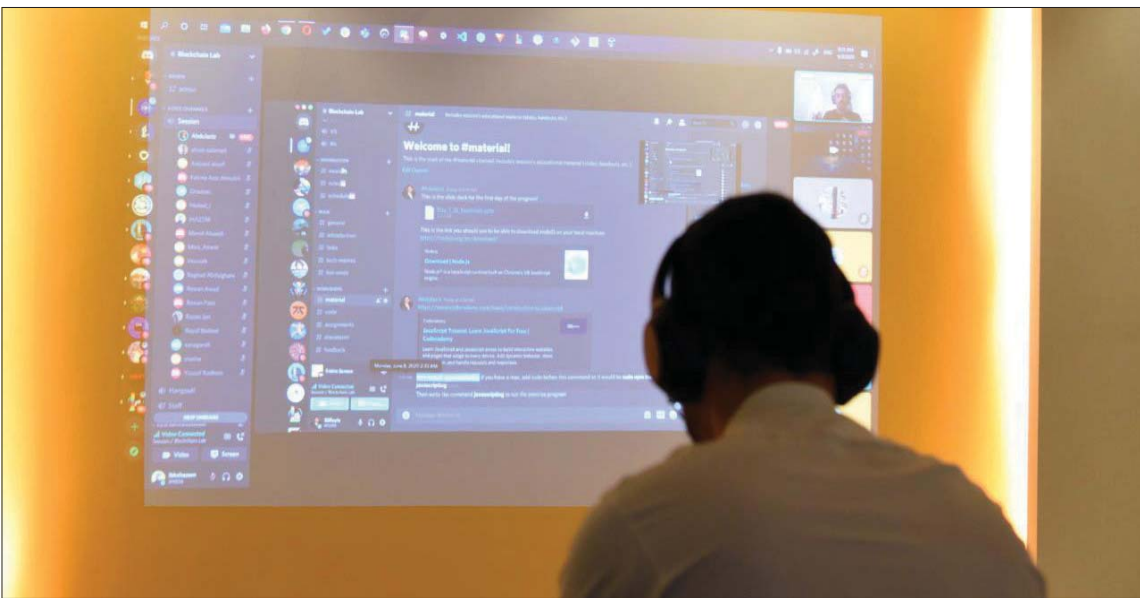
السعودية تتقدم دول الشرق الأوسط في استثمارات الشركات التقنية الناشئة