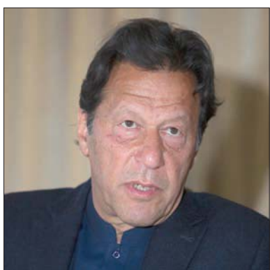
رئيس وزراء باكستان عمران خان

ان حزب «حركة إنصاف باكستان» لديه 157 نائباً في مجلس النواب. وحصل خان على دعم 176 عضواً عند انتخابه رئيساً للوزراء عام 2018. وقال شهيد خاقان عباسي رئيس الوزراء السابق وزعيم المعارضة لوسائل الإعلام خارج مبنى البرلمان «لقد تمت الدعوة لعقد جلسة غير قانونية لخداع الشعب الباكستاني». وأظهرت لقطات لوسائل الإعلام زعماء للمعارضة كانوا يحتجون ويتحدثون لوسائل الإعلام خارج البرلمان عندما أحاط بهم حشد من مؤيدي الحكومة وهاجموهم.