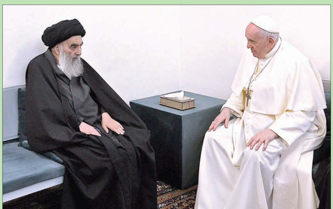
بغداد: «الشرق الأوسط»

جمع لقاء تاريخي في النجف، أمس، بين رئيس الكنيسة الكاثوليكية البابا فرنسيس والمرجع الشيعي الأعلى آية الله علي السيسستاني، وجهاً خالاه نداء من أجل السلام. وطبقاً لبغداد أصدره مكتب السيسستاني، في ختام اللقاء الذي استمر 45 دقيقة، فإن المرجعين بحثا «التحديات الكبيرة التي تواجهها الإنسانية في هذا العصر ودور الإيمان بالله تعالى وبرسالته، والإنتماء بالقيم الأخلاقية السامية في التغلب عليها». وأوضح البيان أن السيسستاني أشار «إلى الدور الذي ينبغي أن تقوم به الزعامات الدينية والروحية الكبيرة في الحد من هذه المآسي». كما أكد «أمن وسلام» المسيحيين العراقيين وحقوقهم.