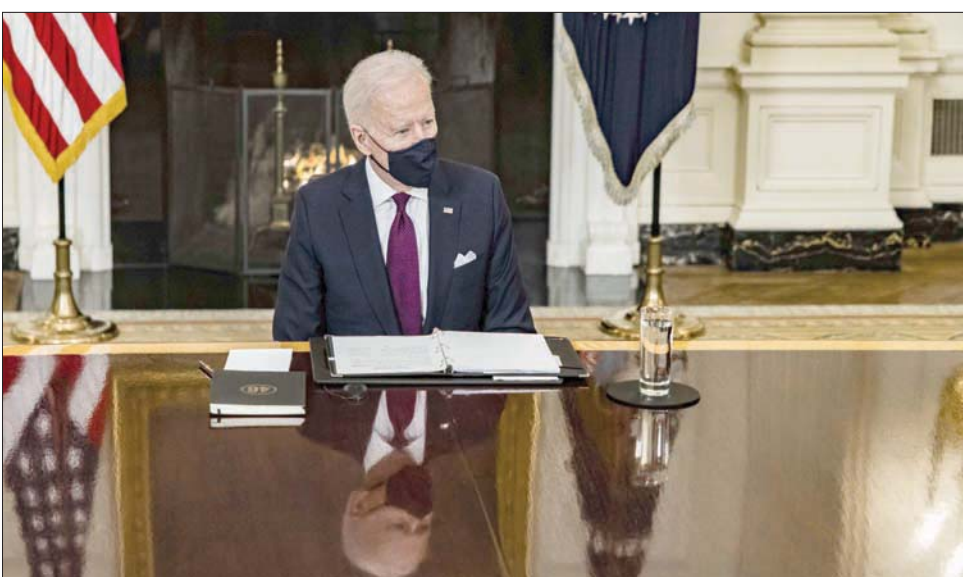
الرئيس الأميركي جو بايدن

أبلغ الرئيس الأميركي جو بايدن المشرعين في الكونغرس أنه مدد لعام آخر «حال الطوارئ الوطنية» لإبقاء العقوبات الأميركية الشاملة على إيران باعتمادها «لا تزال تشكل تهديداً استثنائياً» للولايات المتحدة، مشيراً إلى عدوانية النظام الإيراني، ودعمه للجماعات الإرهابية، فضلاً عن «النشاطات الخبيثة» لما يسمى «الحرس الثوري».