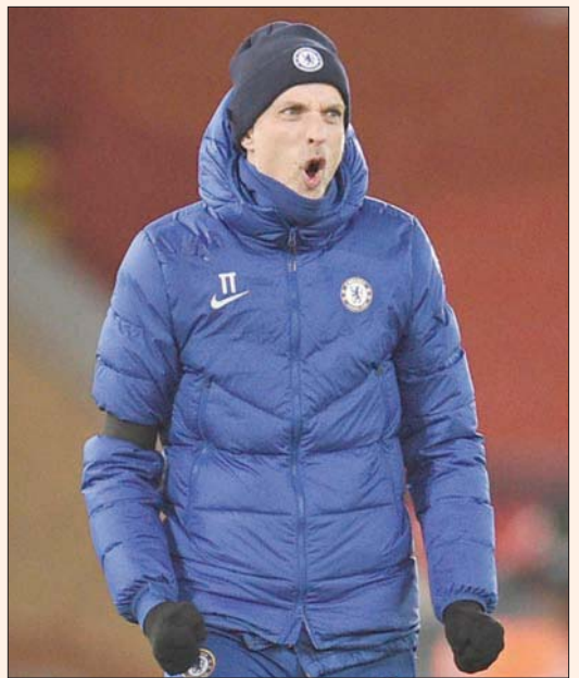
توخييل مدرب تشيلسي

لندن، الشرق الأوسط، إدارة كل الظروف بشكل جيد جداً». وتفوق توخييل على ديبغو سيميوني الأسبوع الماضي، في الفوز 1 - صفر على مضيفه أنتليكو مدريد في ذهاب دور الـ16 بدوري أبطال أوروبا، وظهر السبب وراء تعاقدهم الفريق مع المدرب الألماني الدقيق خلفاً للامبارد. وكان فريقه أكثر حسماً من ليفربول في الشوط الأول. وهاجم، وعندما احتاج للدفاع بعد الاستراحة كان بالهدوء الذي يبشر فيما تبقى من الموسم.