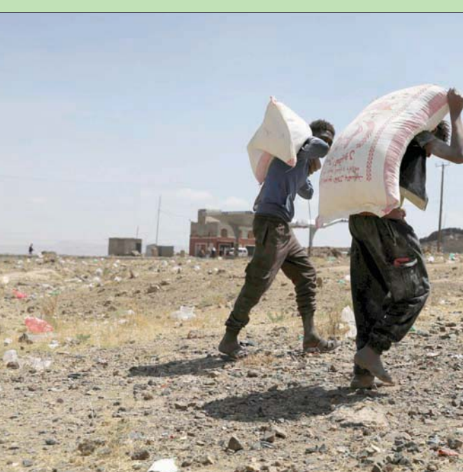
يمنيون يحملون مساعدات إغاثية في صنعاء