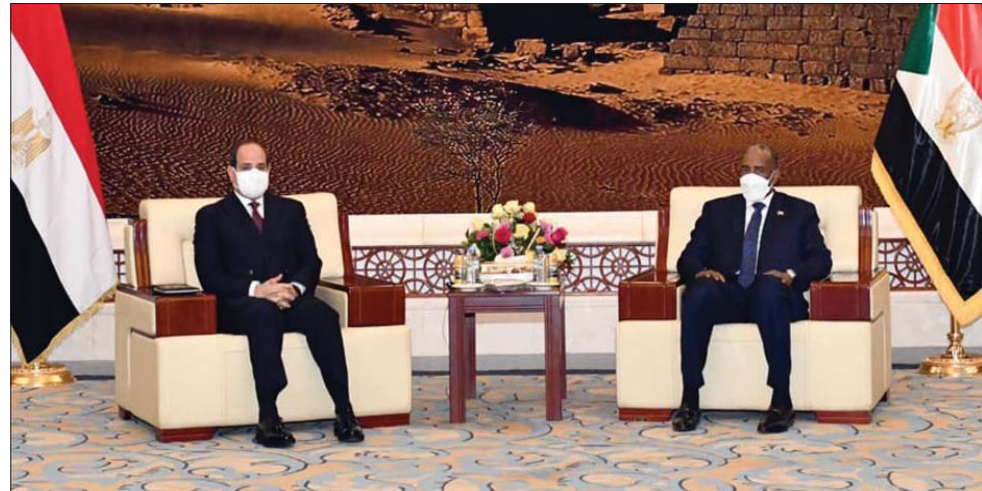
البرهان خلال لقائه الرئيس السيسى في القصر الجمهوري في الخرطوم أمس

البرهان والسيسي رفضا سيطرة أديس أبابا على النيل الأزرق واتفقا على مظلة دولية رباعية لمفاوضات السد