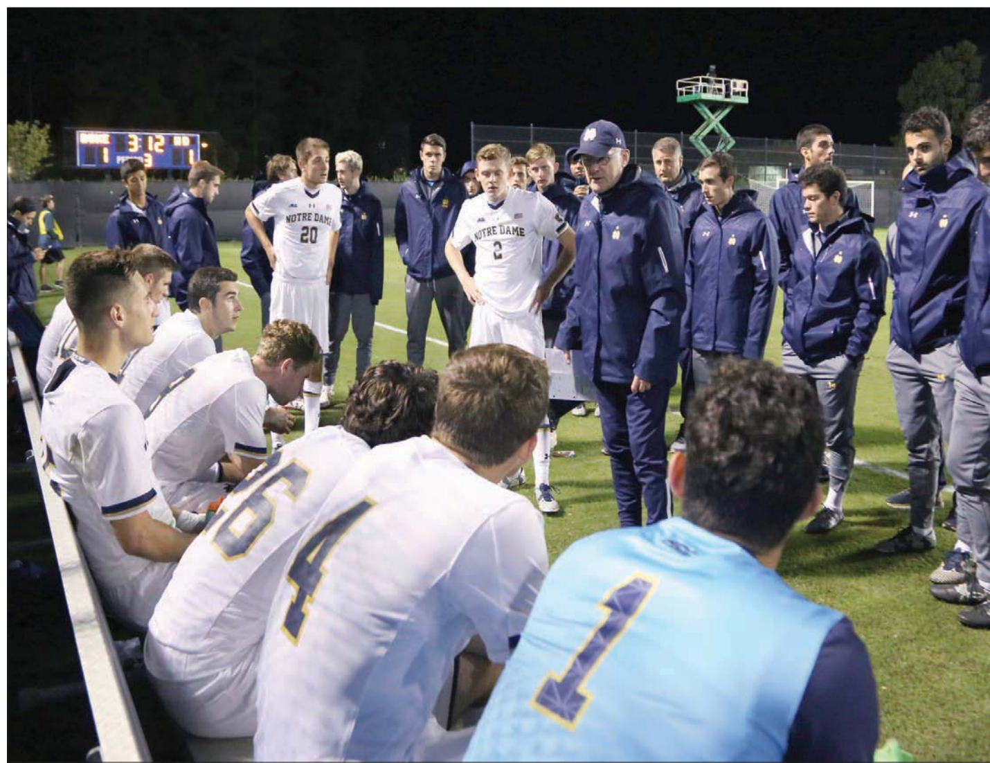
هناك رغبة كبيرة في إحضار المدربين الأجانب إلى الولايات المتحدة لتدريب فرق الشباب

ولا يزال لدى الولايات المتحدة شرائح كبيرة من السكان ترى أن اللهجة الأجنبية تمثل الأصالة والعراقة في عالم كرة القدم، والدليل على ذلك أن معظم معلقى المباريات يتحدثون اللهجة الإنجليزية وليس الأمريكية. وعلاوة على ذلك، تلتهت أندية الدوري الأمريكي لكرة القدم بحثاً عن مدربين أجانب فشلوا في مضاهاة الإنجازات التي حققها المدربون الأمريكيون مثل بروس أرينا وكاب برنر وبريان شميترز. وعلى مستوى الشباب، يدخل الآباء في منافسة محمومة في نظام «الدفع مقابل اللعب» الأمريكي الفريد من نوعه. ونظراً لأن هذا النظام يزيد احتمالية القبول التفضيلي في الكلية والحصول على المنح الدراسية، يضغط الآباء بشدة لإيصال أطفالهم إلى ما يعتقدون أنه مؤسسات النخبة، حيث يدفعون آلاف الدولارات كل عام للحصول على امتياز أن يتدرب أطفالهم على يد مدرب «محترف» يستفيد من الاتصالات مع المدربين في الكليات.