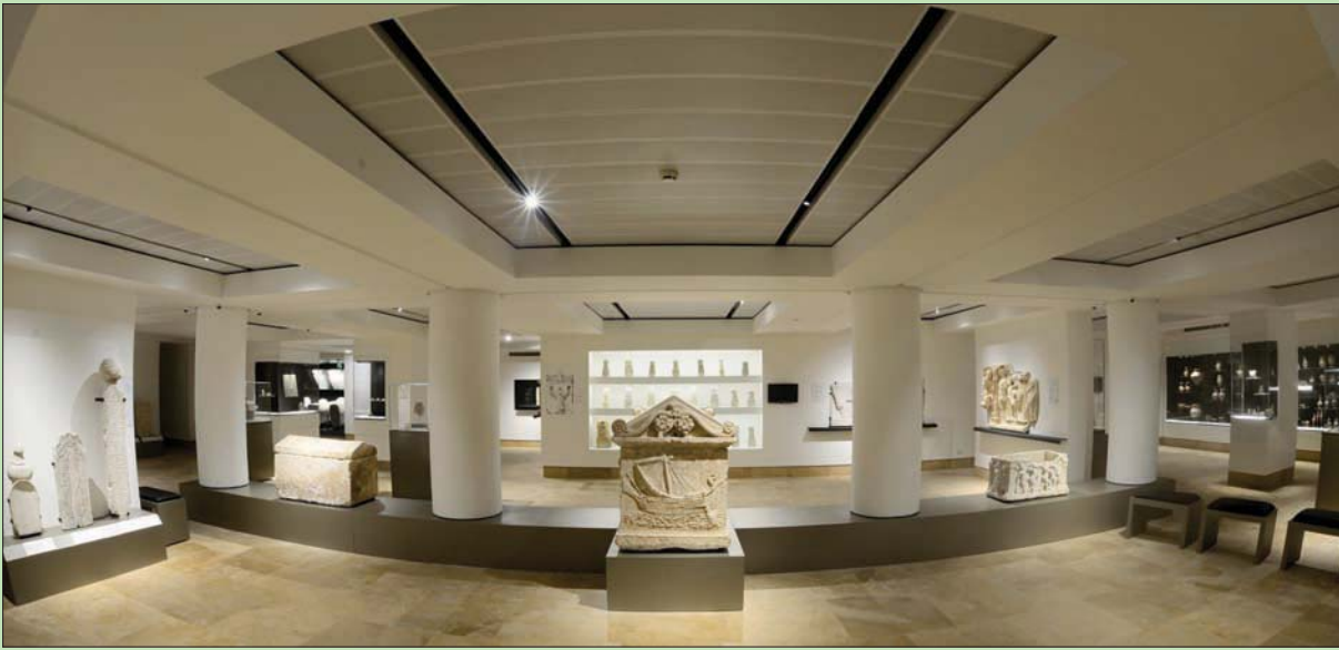
مشهد عام للطابق السفلي الخاص بالاعادات الجنائزية في المتحف الوطني اللبناني