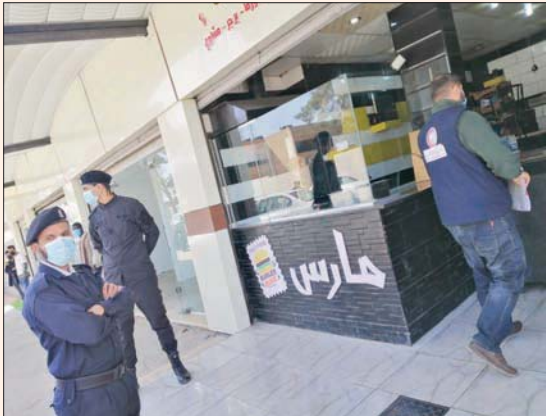
القاهرة، جمال جوهر

كثفت السلطات الطبية والأمنية في ليبيا من إجراءات التفتيش والمراقبة على الأسواق الشعبية والمحال التجارية لمتابعة تنفيذ الإجراءات الاحترازية ومدى التزام المواطنين ومدى ارتداء الكمامات والمداومة على التعقيم، بينما وجهت انتقادات واسعة لحكومة «الوفاق» لتأخرها في استيراد لقاح «كورونا».