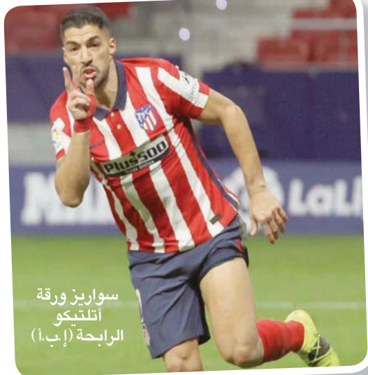
سواريز ورقة التوتكو (إبأ)

لندن، الشرق الأوسط، أراد أحد اللاعبين الرحيل لأننا لم نتاهل إلى دوري الأبطال، هنا أيضاً لا أريده. الأمر لا يتعلق بمسألة شخصية لكن الأمور هي كذلك». وطمان جماهير ليفربول بأن النادي يسير على الطريق الصحيح بقوله: «أطلب من جميع أنصار النادي عدم القلق. النادي في أياذ أمينة ويملك فريقاً رائعاً في الترتيب يجب أن تفوز. علينا انتزاع هذا عن استحقاق، حققنا انتصحين في الدوري المحلي علينا الفوز في المواجهات الثنائية، علينا القتال والتدريب بشكل أفضل لكننا فقدنا الكرة كثيراً».