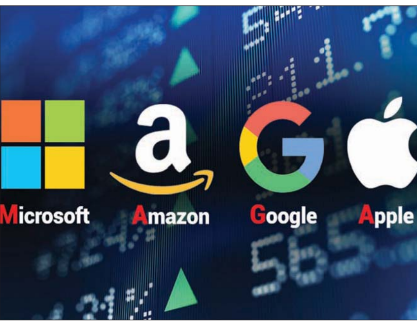
أبرز شركات التكنولوجيا الدولية مهددة بدفع ضرائب أكبر في بريطانيا

محدودة للغاية حتى الآن. وكان من المفترض أن يجمع الصندوق 200 مليار يورو (238 مليار دولار)، لكن تم توقيع عقد تمويل فقط بقيمة مائة مليون يورو، بنهاية يناير (كانون الثاني) الماضي. وأكد البنك، وفق وكالة الأنباء الألمانية، أنها أحدث الأرقام المتاحة. وكانت هناك شهور من التأجيل في إنشاء الصندوق، الذي انفتحت عليه دول الاتحاد الأوروبي في أبريل (نيسان) 2020، في إطار صفقة بقيمة 540 مليار يورو. ووصف رئيس البنك، فيرنر هوير الصندوق في ذلك الوقت بأنه «استجابة في الوقت المناسب وهادفة للشركات الأوروبية الصغيرة ومتوسطة الحجم».