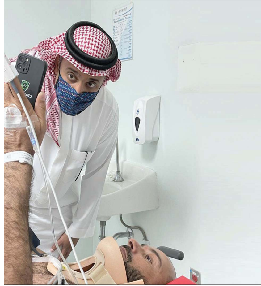
الأمير خالد بن سلطان العبد الله الفيصل أثناء زيارته للسعودي يزيد الراجحي الذي تعرض لحادث أمس

بعد الحصول على موافقة الاتحاد الدولي للسيارات والجهات ذات العلاقة مشيراً إلى أنه تم حدوث حالتي وفاة في السباق السابق فيما