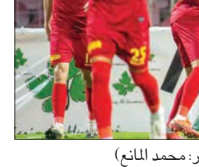
لاعبو ضمك يحتفلون بتفوقهم على الأهلي أمس

وبعد قرار تأجيل المباريات المقررة في مارس (آذار) وإقامتها بنظام البطولة المجمععة، يلعب المنتخب الإماراتي أمام ماليزيا 3 يونيو، وتايلاند 7 يونيو، على