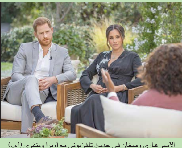
الأمير هاري وميغان في حديث تلفزيوني مع أوبرا وينفري

القاهرة، حازم بدر نجح علاج ألماني استعان به متحف آثار ولاية تيلانجانا بحيدر آباد الهندية، في الحفاظ على مومياء مصرية عمرها 2500 عام، وواجهت خطر التفكك بسبب إصابتها بالتعفن. وكان السبب الرئيسي لتعفن المومياء هو الأكسدة (أي تفاعل الجسد مع الهواء)، وبناء على اقتراحات الخبراء، تم نقل المومياء من الغرفة الخشبية التي كانت توجد بها إلى غرفة زجاجية مستوردة من ألمانيا، تعالج هذه المشكلة. ويقول بي جانجا ديفي، مساعد مدير المتحف، الذي كان يعتني بالمومياء على مر السنين في تقرير نشره، أول من أسس موقع جريدة «هندوستان تايمز» الهندية: «الغرفة المستوردة من ألمانيا متصلة بمصدر لـ (النيوتروجين)، ليزيد باستمرار من هذا العنصر ويزيل الأكسجين، وهو ما قضى