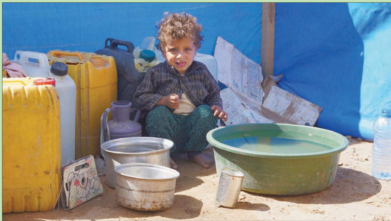
طفل يمني في أحد مخيمات النازحين بمأرب