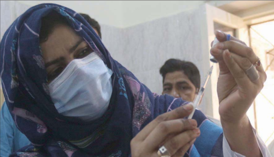
مرمضة تعد جرعة لقاح بمدينة حيدر آباد في باكستان