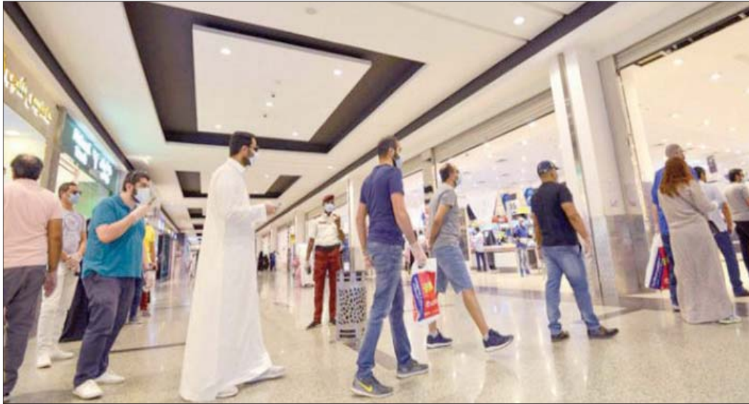
التباعد الاجتماعي عنصر أساسي في الإجراءات الاحترازية

متر ونصف في أماكن تسلم الطلاب والانتظار ومعاملة أفراد الأسرة الواحدة كقرء واحد وعدم إلزامهم بالتباعد بينهم، ووضع آلية لإدارة قائمة الانتظار لمنع تكديس العملاء، ومنع انتظار الأفراد داخل المطعم، ومنع التزاحم والتدافع عند المداخل والمخارج، ومنع تقديم الطعام داخل المطعم في حال تعذر تطبيق مسافة التباعد لـ 2 أمتار، ومنع المشاركة لأكثر من مجموعة على طاولة واحدة، مع مراعاة عدم زيادة عدد الأفراد على الطاولة الواحدة على خمسة أشخاص حتى ولو كانوا من عائلة واحدة وترتيب الطاولات داخل أماكن تقديم الطعام بطريقة تضمن وجود مسافة لا تقل عن ثلاثة أمتار بين الطاولات وتفعيل كاميرات المراقبة (CCTV) والتأكد من تغطيتها جميع المناطق بالمطاعم والمقاهي. بينما أكدت وزارة الصحة في