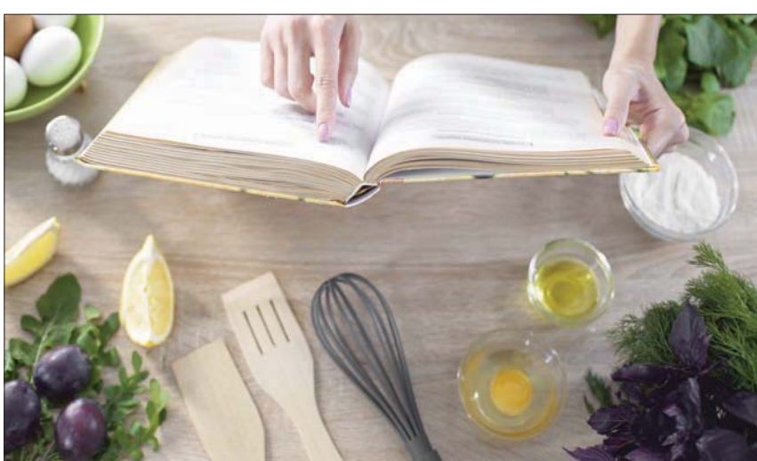
كتاب يعلم الطهي العالمي ويذهب ريعه للمحتاجين في لبنان

بينما سفير ماليزيا لدى لبنان، داتو مهد ازنور ماهات، فيقدم طبقاً خاصاً بالفطور الصباحي، ويتالف من البيض والأرز المسلوق وبقا من الخضار. ولحمي الأكلات المكسيكية والمغربية والإسبانية، في الكتاب طبق «بودن أرتيكا» المكسيكي، ويرتكز على الدجاج المتبل بالثوم، والمغلي بجبن الموزاريلا. ومع طبق «كوسكوس بيداوي» نستكشف معاً ريف دقيقة لوصفة الطبق الأشهر في المغرب. أما طبق «غاسباتشو» من جنوب إسبانيا، فهو نوع حساء نباتي لذيق جداً يجري تناوله بارداً مع قطع خضار طازجة. ويختتم الكتاب وصفاته من بريطانيا مع سفرها لدى لبنان كريس رامبلنج، وهو اختار طبق «Beef wellington» الذي يمكن تقديمه في جميع المناسبات. واعتبره السفير البريطاني أحد أفضل الأطباق، منذ كان صغيراً. رحلة غذائية عريقة بخوضها قارئ كتاب الطبخ «عشاء مع الدبلوماسيين»، حيث يسافر إلى بلدان مختلفة، مكتشفاً خصائص أطباقها العريقة، فيشعر بالرضا والاكتفاء في زمن «كورونا».