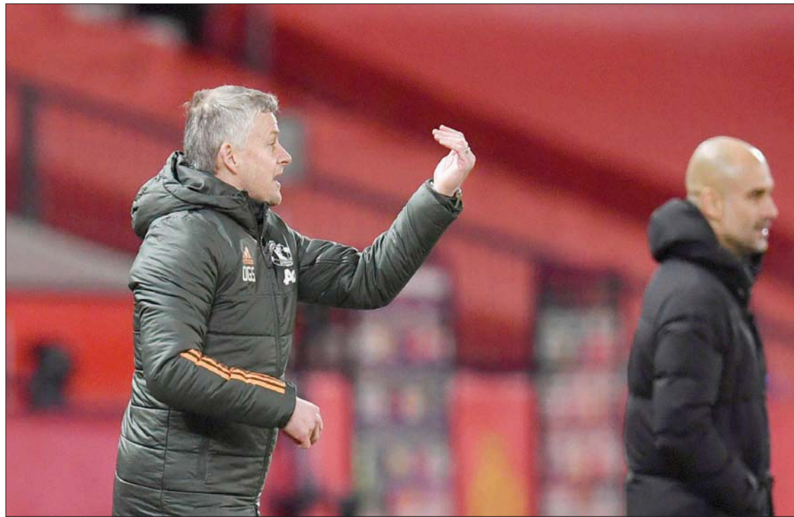
غوارديولا وسولسكاير ومواجهة أخرى ساخنة

في الدوري الإنجليزي أمام تشيلسي وكريستال بالاس. وقال سولسكاير للصحافيين: «مضينا أسبوعاً بدون تسجيل أي هدف. ليس الأمر كما لو كنا بعيدين عن مستوانا ستة أسابيع. هزمنا سوسيداد 4 - صفر (في مباراة الذهاب) وساوتهامبتون 9 - صفر. لا أتفق مع ما يتردد بشأن