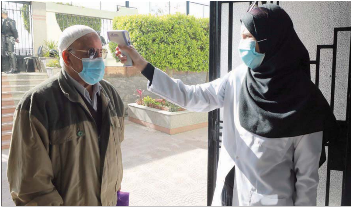
قياس حرارة رجل قبل منحه اللقاح في القاهرة

في وقت تواصل السلطات الصحية في مصر تطعيم أصحاب الأمراض المزمنة وكبار السن بلقاحات فيروس «كورونا» رسميون إلى أن «مصر تتوسع لتوفير لقاحات كوفيد - 19 لمواطنيها، فضلاً عن العمل على أكثر من لقاح مصري».