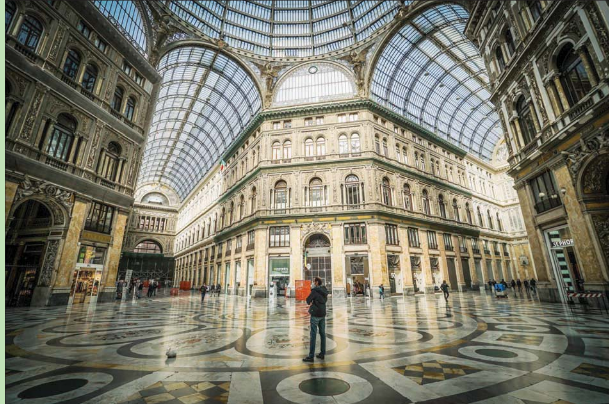
قلعة من الناس يسبرون في شوارع وسط مدينة نابولي شبه المهجورة. ومن معالمها، حي يومي الأثري والكنائس القديمة والقصر الملكي وجيزيرتا كابري وإسكيا. ويعود إقليم كامبانيا إلى منطقة «كوفيد الحمراء» اعتباراً من الاثنين بعد تزايد في الإصابات بفيروس «كورونا». (أ.ب.أ)

لوس أنجليس - لندن: «الشرق الأوسط» سعيد مجمع ديزني لاند ومراكز ترفيهية أخرى إضافة إلى الحدائق في الهواء الطلق ابتداء من الأول من أبريل (نيسان) في حال لم تعد المقاطعة أرجوانية»، وهو مستوى الخطر للمجهور، بعد أن أعلنت كاليفورنيا تخفيف القيود الصحية المتصلة بجائحة كوفيد-19. ويأتي هذا القرار إثر ضغوط قوية مارستها مشغلو المجمعات الترفيهية، والتراجع السريع في عدد الإصابات الجديدة بفيروس كورونا في الولاية التي تضررت بشدة جراء الجائحة خلال الشتاء، حسب وكالة الصحافة الفرنسية. وبفضل هذا التحسن، «يمكن للحدائق الترفيهية أن تعاود بصورة تدريجية وأمنة فتح بعض الأنشطة، خصوصاً تلك التي تقام في الخارج والتي يمكن فيها وضع كامات»، على ما قال المسؤول عن قطاع الصحة في كاليفورنيا مارك غالي في بيان.