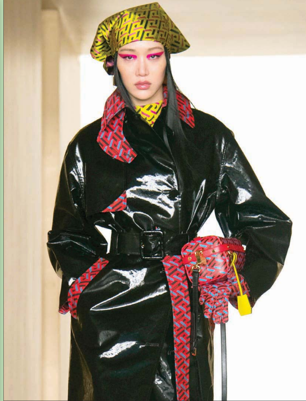
عارضة تعرض رياً من مجموعة «فيرساتشي» لخريف وشتاء 2021/2022 في أسبوع الموضة بميلانو