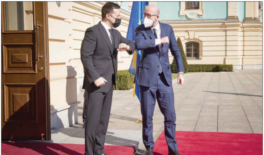
الرئيس الأوكراني (يسار) لدى استقباله رئيس المجلس الأوروبي الذي زار خط المواجهة في أوكرانيا

تقدم مساعدات لمنطقتي دونيتسك ولوغانسك اللتين مزقتها الحرب، في جزيرة القرم الأوكرانية. تدهور. وقالت فلورنس جيليت، رئيسة بعثة الصليب الأحمر في أوكرانيا، لوكالة الصحافة الفرنسية في فبراير: «اضطررنا لتأجيل بعض رحلاتنا بسبب القصف الليلي»، موضحة أنها المرة الأولى منذ أشهر التي يحدث فيها ذلك. وقال الكرمين الخميس إنه «قلق للغاية بشأن التوتر المتزايد» على الجبهة، وحذر من «حرب شاملة».