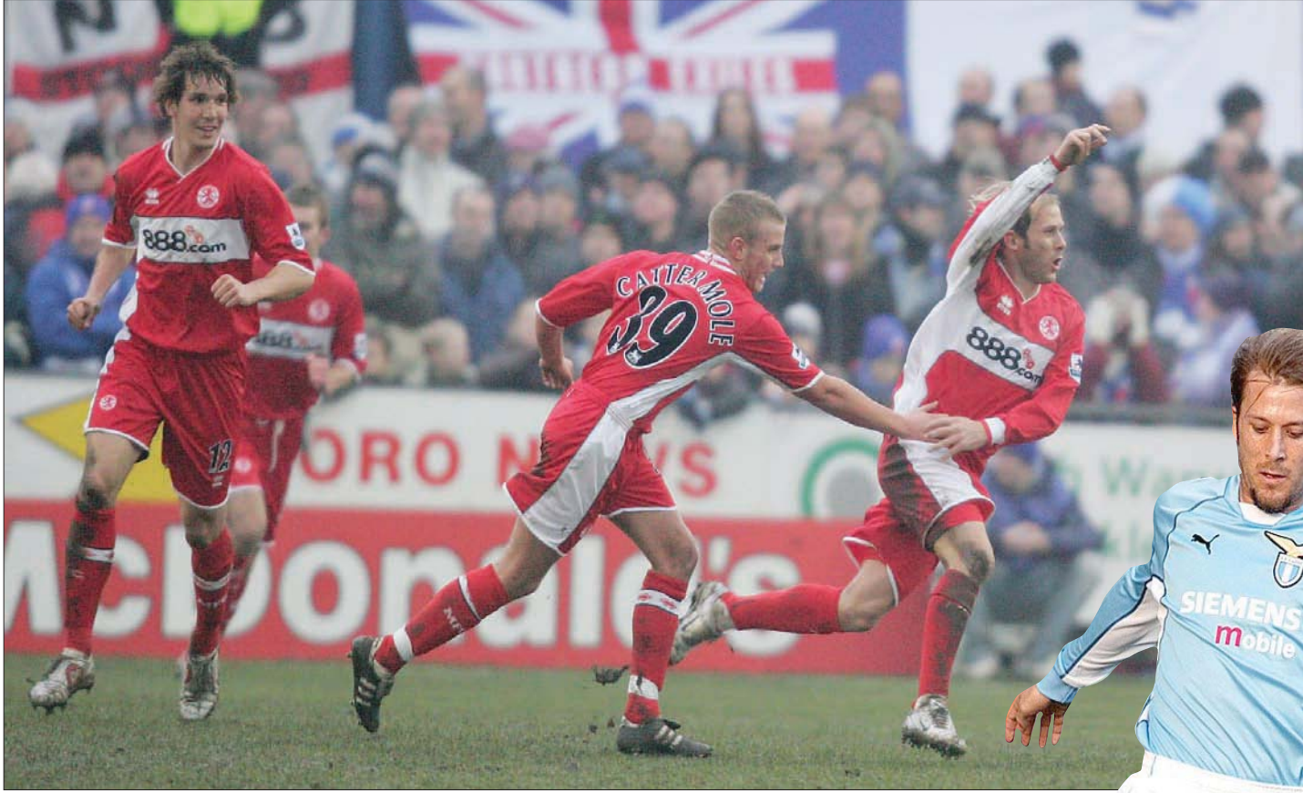
مينديتا أنهى مسيرته الكروية مع ميدلسبره في ظروف غير جيدة بعد خلافات مع المدرب آنذاك ساوثغيت

القبولية عندنا، وقد تحدثت معه كثيراً في هذا الأمر. لقد كانت التدريبات تتم بالطريقة الإيطالية تماماً، حيث كنا نحمل الكثير من الأوزان ونقفز كثيراً ونبدل مجهوداً كبيراً، وكنا نقول له في بعض الأحيان إنه يتعين علينا أن نتدرب بشكل أكبر على الكرة وليس التدريبات البدنية، لكننا مع الوقت تكيفنا مع ذلك».