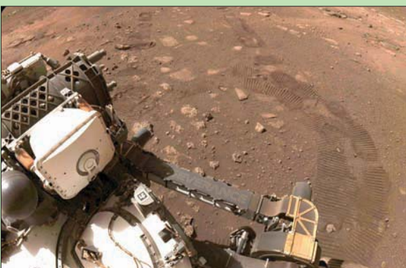
المسبار «برسيفيرنس» يتحرك لبضعة أمتار على المريخ