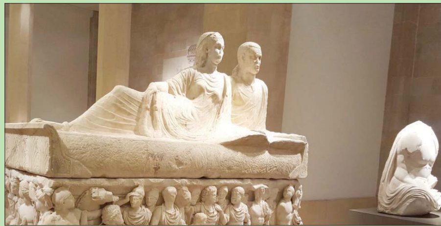
ناووس يحمل نحتاً أروزيين يعطي فكرة عن المراحل الأولى لهذه التصاميم