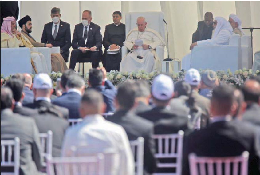
البابا فرنسيس خلال لقائه المرجع الشيعي علي السستاني في مقره بالنجف أمس... ويتحدث في لقاء للأديان بموقع أور بمحافظة ذي قار الجنوبية

بالكوفة الدكتور غالب الدعيمي في حديثه لـ«الشرق الأوسط»، أن «زيارة البابا ببعدها السياسي حصرها، حيث إن العالم يصنف الحكومة العراقية الحالية من ضمن الحكومات المدنية»، مبيّناً أن «هذا يعني أنها ستدعم من مصادر القرار الدولية، فضلاً عن أنها رسالة واضحة للمداخل بأن الحكومة العراقية ماضية في إعادة العراق إلى مكانته العربية والعالية التي تجسدت برؤية جديدة، بدأ العالم يدركها بأن العراق هو البلد الوحيد الذي له المصير في تحقيق التأثير الإقليمي لو حظي بالدمع العالمي الحقيقي».