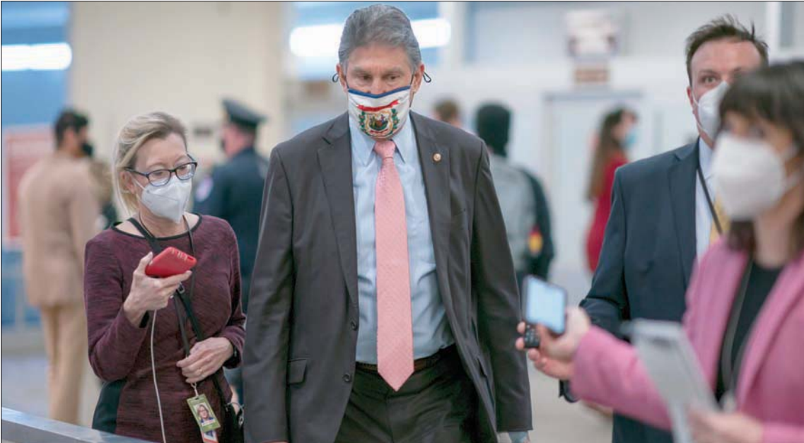
هدد السيناتور الديمقراطي جو مانشين من ولاية ويست فيرجينيا بالانسحاق عن الحزب (أ.ب)

تمكن الديمقراطيون المعتدلون من فرض تعديلات على خطة الإنقاذ الاقتصادي التي قدمتها إدارة الرئيس جو بايدن بقيمة 1.9 تريليون دولار، بعدما هدد السيناتور الديمقراطي في مجلس الشيوخ جو مانشين من ولاية ويست فيرجينيا بالانسحاق عن الحزب. وتهدد كاد يطيح عملياً بهامش الغالبية الضيق للديمقراطيين في المجلس، في ظل تقاسم الأصوات مناصفة مع الجمهوريين. وتطلعت مناقشات مجلس الشيوخ لمدة ساعتين يوم الجمعة، بعد رفض مانشين الموافقة على مدة خطة الإنقاذ وقيمتها والجهات المستفيدة منها، ورفضه رفع الحد الأدنى للأجور إلى 15 دولاراً في الساعة، بسبب مخاوفه من عدد من الديمقراطيين المعتدلين وغالبية الجمهوريين بشأن العجز في الموازنة والتفقات، وحرصه على وصول المساعدات إلى مستحقيها بالفعل.