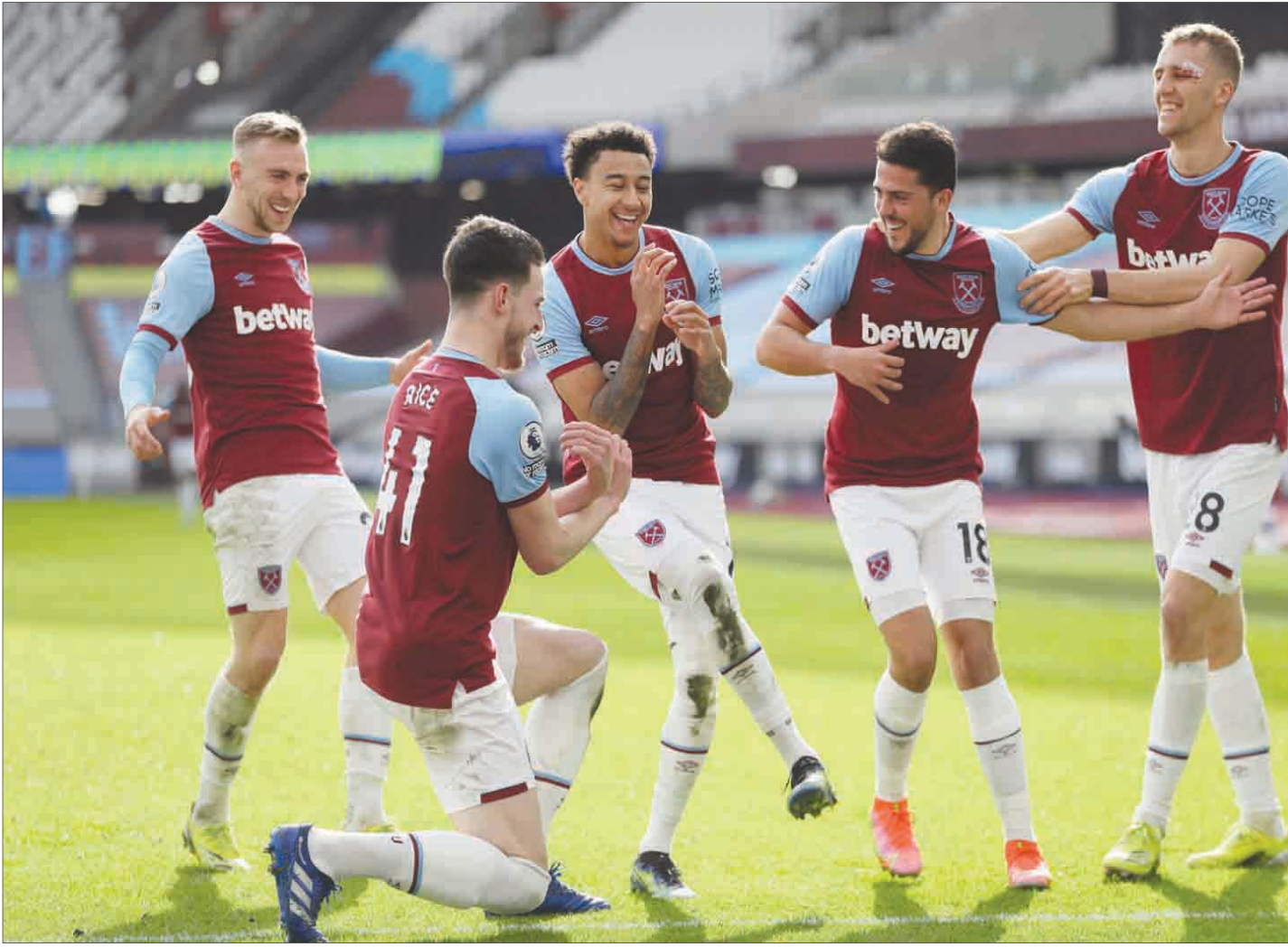
لينغارد يحتفل بهز شبابك توتنهام في الدوري الإنجليزي في الجولة الماضية

لقد أدت حماسة لينغارد بين الحين والآخر على وسائل التواصل الاجتماعي إلى تعرضه للكثير من الانتقادات،