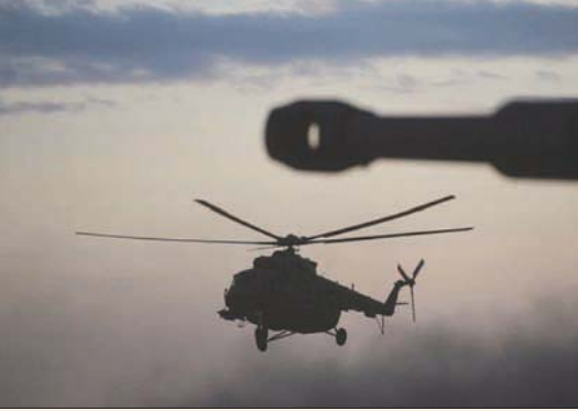
صورة أرشيفية لمروحية روسية من طراز تلك التي سقطت في ريف الحسكة