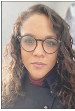
د. دانييل كيلغو

السابق، دونالد ترمب في أعقاب اقتحام الكابيتول. كذلك حضرت نشر أي تغريدات أو منشورات تتعلق بانتخابات الرئاسة الأميركية، وأضافت إلى بعضها تحذيرات تشير إلى أن «ما تتضمنه هذه التغريدات يعد محتوى غير صحيح». وبالتالي، أشرت إلى أن «ما تتضمنه هذه التغريدات يعد محتوى غير صحيح». وبالتالي، أشرت إلى أن «ما تتضمنه هذه التغريدات يعد محتوى غير صحيح». وبالتالي، أشرت إلى أن «ما تتضمنه هذه التغريدات يعد محتوى غير صحيح».