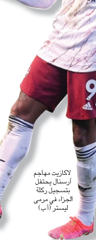
لاكازيت مهاجم أرسنال يحتفل بتسجيل ركلة الجزاء في مرمى ليستر

لندن، «الشرق الأوسط» قلب أرسنال تخلفه بهدف إلى انتصار بثلاثية على مضيفه ليستر سيتي وخرمه من الوصافة ولو مؤقتاً، فيما حقق توتنهام انتصاراً ساحقاً على ضيفه بيرنلي برباعية نظيفة أمس في المرحلة السادسة والعشرين للدوري الإنجليزي الممتاز. على ملعب «كينغ باور» في ليستر تقدم أصحاب الأرض بهدف مبكر عبر البلجيكي يوري تيلمانس في الدقيقة السادسة، ورد المدفعية بثلاثية البرازيلي ديفيد لويز في الدقيقة والفرنسي الكسندر لكاكزيت من ضربة جزاء في الدقيقة 45، والعاجي نيكولاس بيبى في الدقيقة 52. واستعاد أرسنال توازنه محلباً بسرعة عقب الخسارة أمام مانشستر سيتي صفر - 1 في المرحلة الماضية، وحقق فوزه الحادي عشر هذا الموسم ليرفع رصيده 37 نقطة في المركز العاشر. وحرر أرسنال الذي دخل المباراة منتشياً ببلوغه ثمن نهائي مسابقة الدوري الأوروبي (يوروبا ليغ) بفوزه الثمين على ضيفه بنفيكا البرتغالي 3 - 2 حيث ضرب موعداً مع أولمبياكوس اليوناني، مضيفه ليستر من فوزه الثالث توالياً وفرض شراكة الوصافة مع مانشستر يونايتد، وتجمد رصيد ليستر سيتي الذي كان يمني النفس بمداواة جراحه القارية عقب خروجه المفاجئ من الدور الثاني لمسابقة «يوروبا ليغ» بالخسارة أمام سلافيا براغ صفر - 2 إياباً الخميس الماضي، عند 49 نقطة في المركز الثالث. ونجح تيلمانس في افتتاح التسجيل عندما قطع كرة حاول