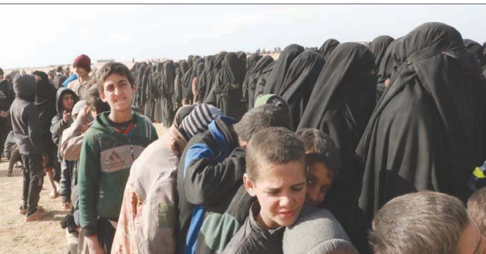
أطفال مع أمهاتهم في مخيم الهول شمال شرقي سوريا

هذا وتستمر اليونيسيف بتقديم المساعدات الإنسانية في مخيم الهول للأطفال والعائلات. وناشدت جميع أطراف النزاع في سوريا، ب«السماح غير المشروط للوصول الإنساني من أجل تقديم المساعدة والرعاية للأطفال والعائلات، بما في ذلك أولئك الموجودين في مراكز الاحتجاز».