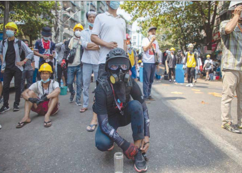
جانب من مظاهرات ضد الانقلاب العسكري في رانغون أمس

وأكدت أن «على المجتمع الدولي أن يتضامن مع المتظاهرين وجميع الأشخاص الساعين للعودة الديمقراطية في ميانمار».