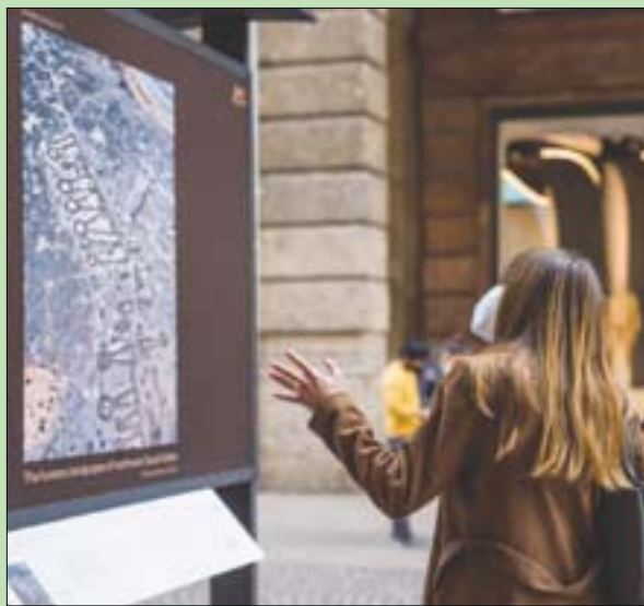
يسلط المعرض الضوء على مواقع العلال الثقافية (الشرق الأوسط)