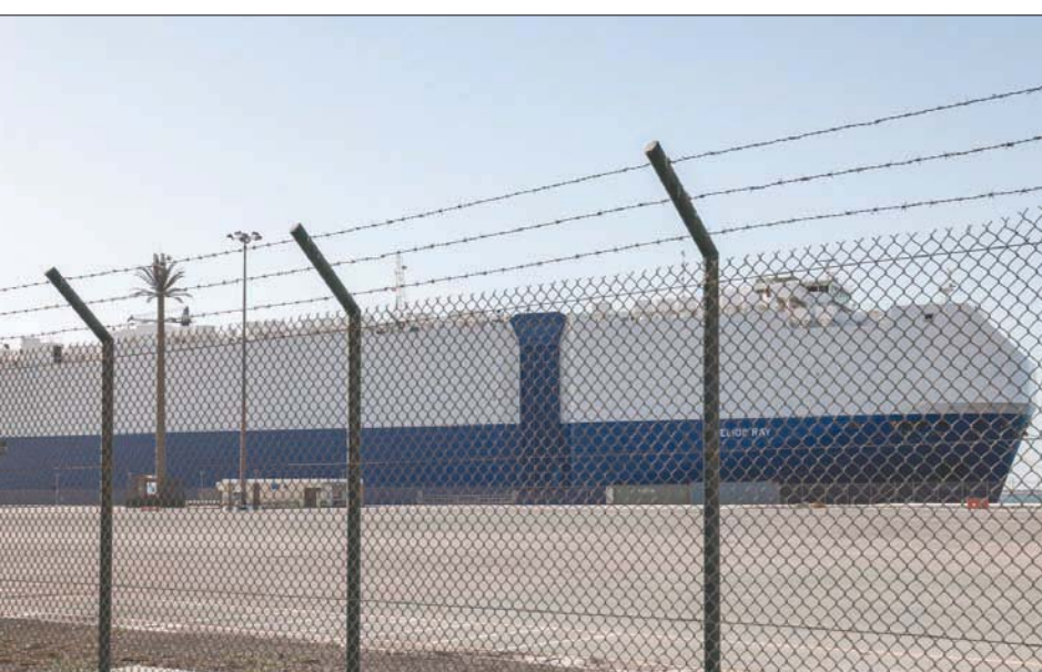
السفينة الإسرائيلية ترسو بـ«ميناء راشد» في دبي بعد وصولها من موقع الانفجار قبالة ساحل مسقط

وسبق للولايات المتحدة أن اتهمت إيران باستهداف سفن وناقلات نفط في منطقة الخليج، في سبتمبر 2019.