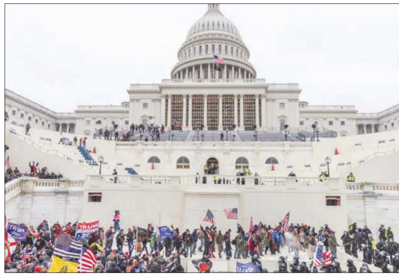
الهجوم على مبنى الكابيتول

وفي أعقاب «الاضطرابات» التي شهدها مدن أميركا بعد مقتل المواطن الأسود جورج فلويد على يد رجل شرطة أبيض، خلال العام الماضي، تعهدت بعض المؤسسات الإخبارية بمعالجة أوجه القصور في تغطيتها، وكيفية تغطية المراسلين للاحتجاجات، وهكذا، عدلت وكالة أنباء «أسوشيتد برس»، الأميركية، في أكتوبر (تشرين الأول) الماضي دليلها الخاص بالكتابة، وحددت متى تستخدم كلمات مثل «شغب» و«ثورة»، و«احتجاج» و«اضطراب». وذكرت فيه أنه «على الصحافيين التزام الحذر في اختيار المصطلح الأفضل لوصف الأحداث، فكلمة «شغب» تعني مشاركة مجموعة من الأشخاص في أعمال «عنف» تهدد السلم، وهو مصطلح يشير إلى «الفوضى غير المنضبطة...» و«أوضحت كيلغو أن «كلمة شغب» مليئة بالدلالات السياسية والثقافية. ومهم جداً وضع هذه الدلالات في الاعتبار قبل استخدامها في وصف المظاهرات، إذ أنها تكون مناسبة لوصف أحداث كاذبون على الناس لا مناسبة في أخرى». ثم أضافت «إذا كانت احتجاجات مقتل جورج فلويد، هي التي دفعت إلى بداية الحساب الإعلامي حول تغطية الاحتجاجات على حد قولها - فإن أحداث اقتحام مبنى الكونغرس قد تكون السبب في فهم أهمية معالجة الإعلام للأحداث بشكل أفضل».