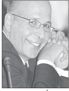
د. مأمون فندي

كلمة «استيعاب» في عنوان المقال قصدت بها معنيين اثنين: الأول بمعنى الفهم، والآخر بمعنى الإحتواء وتحمل الصدمات. في الكتابات العربية عن السياسة الأميركية قليل مما يثير الاهتمام نتيجة لعدم الاستيعاب والفهم لطبيعة النظام الأميركي مجملاً ولطبيعة تفاعلات الأطراف التي واشنطن، أو حتى طبيعة اللغة التي تكتب بها واشنطن أو تحدثها. ولنبداً بمثال يوضح ما قلته للتو، فمثلاً في حديث وزير الخارجية الأميركي مع نظرائه في العالم، من بريطانيا إلى فرنسا إلى إسرائيل أو مصر، نجد عبارة «حليف استراتيجي» (strategic ally) عندما يتحدث عن بريطانيا، ونجد أيضاً تعبير «شريك استراتيجي» (strategic partner) عندما يتحدث عن مصر.