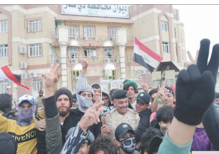
محتجون يرحبون بضابط بعد نشر قوات عسكرية بدلاً من «قوات مكافحة الشغب» أمس

كان رئيس الوزراء، كلف، الجمعة الماضي، الأسدي، بمنصب محافظ ذي قار، بدلاً من ناظم الوائلي، ووجه بتشكيل لجنة للتحقيق في الأحداث وإنشاء مجلس استشاري من الشخصيات المرموقة في ذي قار ترتبط به مباشرة لمتابعة إعمار المحافظة. من ناحية أخرى، اعترفت جماعات الحراك في بقية المحافظات بتنظيم زيارة إلى مدينة الناصرية بعد غد لتقديم العزاء إلى عوائل القتلى والدعم والإسناد إلى المظاهرين هناك. وتميل غالبية جماعات الحراك إلى عدم التصعيد هذه الأيام للحيلولة دون التأثير على زيارة بابا الفاتيكان إلى العراق المقررة في الخامس من مارس (آذار) الحالي، لكنهم لا يستبعدون موجة تصعيد جديدة عقب انتهاء مراسم الزيارة قد تطيح بالإدارات الرصاص الحي أثناء المظاهرات، ووجهنا بسحب عناصر