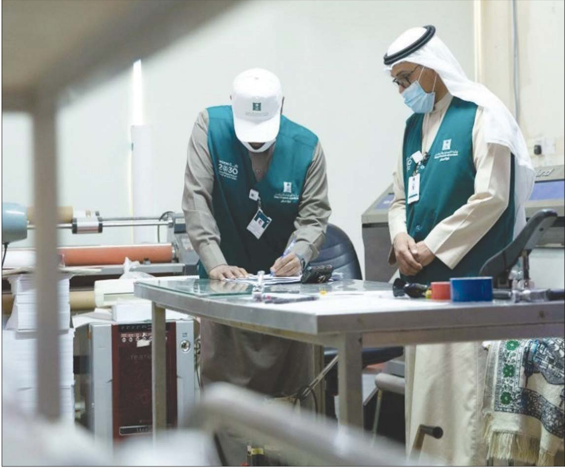
السعودية تطلق مبادرة لمخالفتي التستر التجاري تمهلهم حتى أغسطس المقبل (الشرق الأوسط)

وقال وزير التجارة، الدكتور ماجد القصبي، في تغريدة على موقع التواصل الاجتماعي «تويتر»: «بداننا العمل بلائحة تصحيح أوضاع مخالفتي نظام مكافحة التستر»، مضيفاً: «هي فرصة ثمينة للراغبين في التصحيح، أدهوم للاستفادة من مزاياها». ويستطيع المخالفين تصحيح المخالفة من خلال