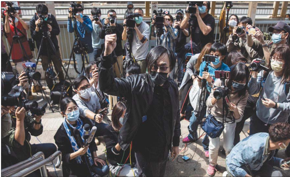
ناشط حقوقي يتحدث للإعلام خارج مركز شرطة في هونغ كونغ أمس

وقد أعرب الاتحاد الأوروبي أمس عن «قلقه البالغ»، وقال مكتب الاتحاد الأوروبي في هونغ كونغ إن «طبيعة هذه الاتهامات تثير أنه لن يتم التسامح مع التعددية السياسية المشروعة بعد الآن في هونغ كونغ». وكانت المستعمرة البريطانية السابقة تمزج بأسوأ أزمة سياسية منذ