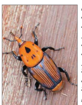
سوسة النخيل الحمراء