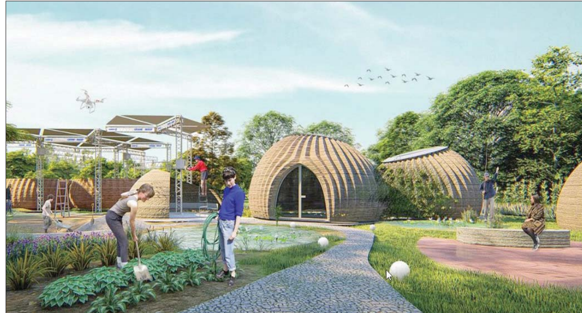
يُعد مشروع «تيكلا» أول المشروعات السكنية بالطباعة ثلاثية الأبعاد، ومن طين محلي المصدر استخدمه لقرون في دول كالهند كبدليل للإسمنت، غير مكلف وصديق للبيئة. ويتميز الطين بمقاومة التحلل وإعادة التدوير ويعد بتصفير النفايات الصادرة عن هذا البناء.

تأقلم مع المناخ استوحى الشركتان اسم المشروع من مدينة خيالية تحدث عنها الكاتب إيتالو كالفينو، وسيتم بناؤه باستخدام عدد من الطباعات ثلاثية الأبعاد، التي ستعمل مع بعضها في وقت واحد، الأمر الذي سيُعتبر إنجازاً بحد ذاته نظراً لحجم المشروع. صُمم المشروع السكني ويُني ليتناقل مع بيئات متعددة، وفقاً لموقع «يانكو ديزاين»، وليكون قادراً على الإنتاج الذاتي باستخدام «أدوات صانع الاقتصاد المبدئ» من «واسب».