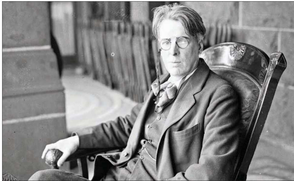
الشاعر الإنجليزي وليم بتلر ييتس