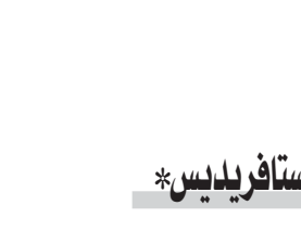
جيمس ستارنيليس *

العراق». ما التفكير وراء الهجوم الأميركي الأخير، وهل سوف يؤدي فعلاً إلى خفض التصعيد وتهذبة حدة المواجهة مع إيران في المنطقة؟ كنت قد وجهت الأوامر بشن كثير من الضربات، بصفتي قائداً عسكرياً على مدار سنوات خدمتي في القوات البحرية الأميركية، غير أن حالة واحدة منها هي الأكثر أهمية بالنسبة لي. وكان ذلك في أواخر صيف عام 1998، ضد أحد معسكرات