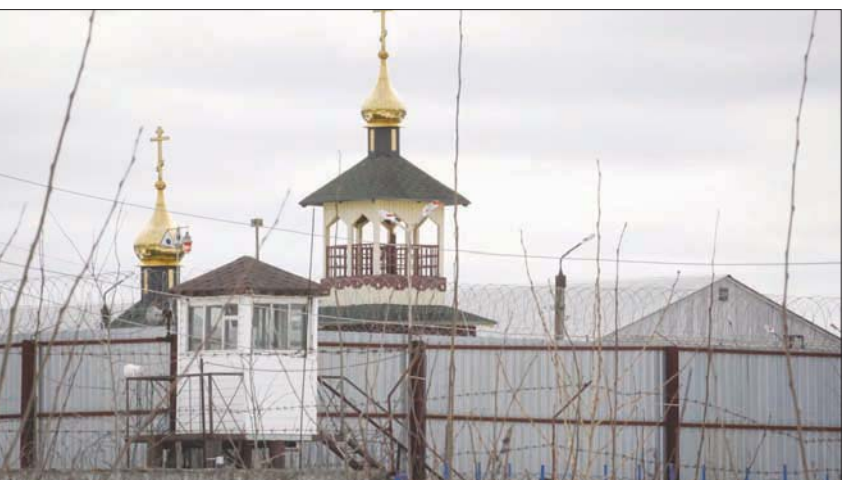
السجن الذي نقل إليه نافالني في بوكروف

وأكد القضاء الروسي الأسبوع الماضي إدانة المعارض البارز، البالغ 44 عاماً، في قضية احتلال تعود للعام 2014 التي يعتبرها نافالني، وعواصم غربية عدة ومنظمات غير حكومية «سياسية»، وأثار توقيفه في 17 يناير مظاهرات واسعة في روسيا، ألقت خلالها السلطات القبض على أكثر من 11 ألف شخص، مع فرض غرامات وعقوبات قصيرة بالسجن، وحكم على نافالني أيضاً بغرامة، بعد إدانته بتهمة «الشبهان» بمقاتل سابق في الحرب العالمية الثانية، فيما تنتظر قضايا أخرى أمام المحاكم، المحكمة، وأن هذه المؤسسة «لا يواجه في إطاره احتمال الحكم عليه بالسجن 10 سنوات، وأمرت المحكمة الأوروبية لحقوق الإنسان روسيا الأسبوع الماضي بالتحقيق مع نافالني، سيما أنها أشارت إلى أن حياته معرضة للخطر في السجن، لكن موسكو رفضت الدعوة.