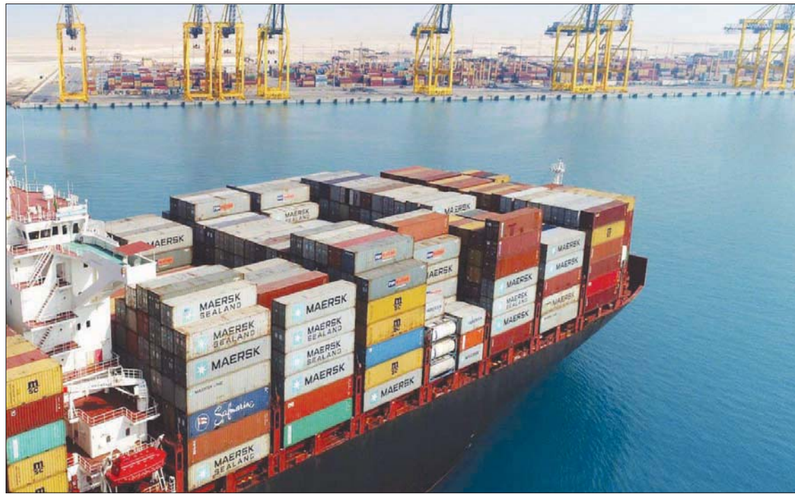
الموانئ السعودية تواصل تطوير إجراءاتها لتقليل وقت الجمركة

تمتع بعدة أوراق في الصناعات والتجارة؛ كونها عضواً في المنظمة العالمية للصناعة، والمنظمة إلى اتفاقيات إقليمية ودولية متعددة الأطراف، وتلتزم بقواعد التجارة الدولية، وتسعى لتحقيق تنمية اقتصادية مستدامة يقودها القطاع الخاص في ظل «رؤية المملكة 2030»، في القطاع الخاص تقدر بنحو 24 مليار ريال (6,4 مليار دولار). وأوضح أن المملكة أصدرت لـ70 شركة محلية ودولية تراخيص قوامها 114 رخصة حتى نهاية العام الماضي، لتمكينها من موازلة عدة أنشطة الصناعات العسكرية، إذ بلغت نسبة الرخص الممنوحة بالصناعات في المائة و18 في المائة من نصيب التوريد، في حين وصلت نسبة الشركات الوطنية المرخصة في هذا القطاع إلى 81 في المائة، والأجنبية والمختلطة إلى 19 في المائة.