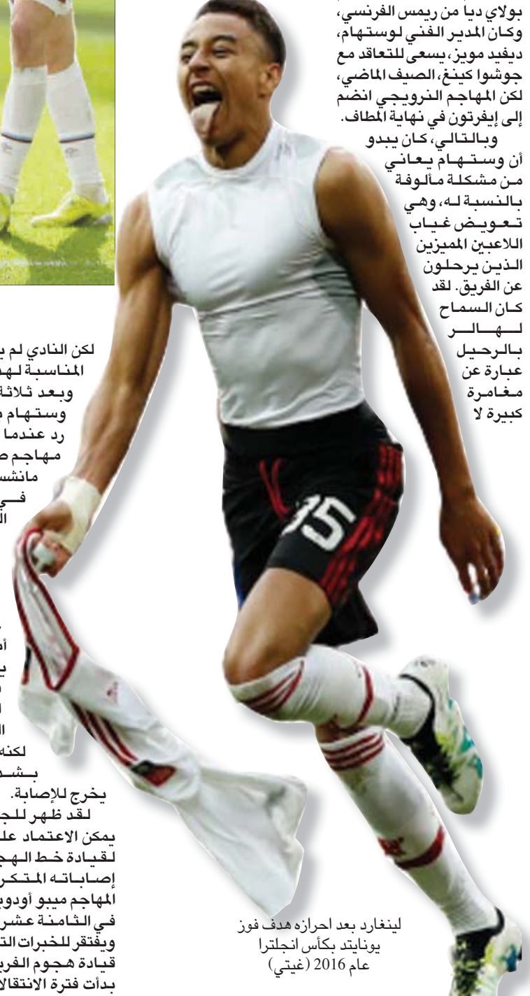
لينغارد بعد احرازه هدف فوز يوناييد بكاس إنجلترا عام 2016

صوفوف الفريق. وحتى عندما تعاقد النادي مع هالز فإنه أبرم هذه الصفقة بمقابل مادي كبير للغاية وصل إلى 45 مليون جنيه إسترليني، كرد فعل سريع على رحيل ماركو أرماتوفيتش في يوليو (تموز) 2019. وفي هذا السياق، كان الأمر يستحق التوقف للحظة ودراسة الأمور بعناية، فهل كان من الحكمة أن ينفق النادي بقوة من أجل تحسين صورته والرصد على الانتقادات فقط؟