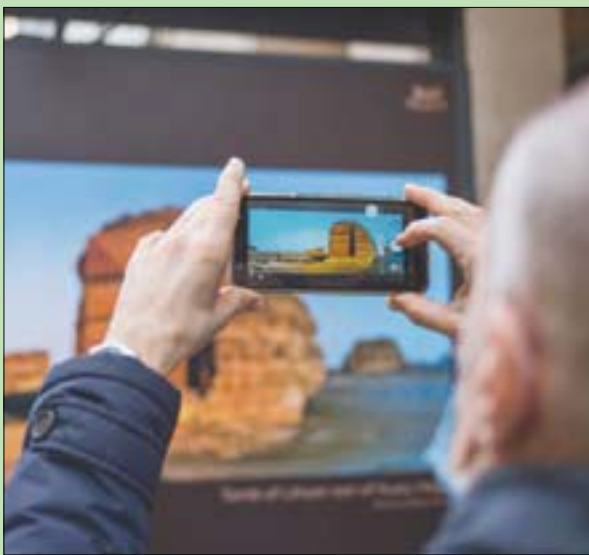
يسلط المعرض الضوء على مواقع العلال الثقافية (الشرق الأوسط)

علق المصور روبرت بوليدوري أنّ البيئة الطبيعية في العلال مذهشة ولا مثيل لها، مضيئاً: «أحاول تقديم ما أسماه صورة رمزية، تغلف موضوعاً بالكامل في كثير من الأحيان من خلال إظهار تفاصيله لتبيان الكل والعكس صحيح»