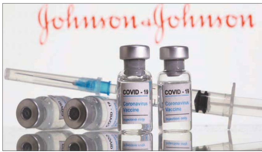
لقاح «جونسون أند جونسون» يتكون من جرعة واحدة

وفي سياق آخر، نشرت شبكة «سي إن إن» الأميركية، تحقيقاً صحافياً مطولاً عن جهود الحكومة الصينية في تكميم الأفواه التي كشفت عن منشأ فيروس كورونا، قالت فيه إن الحكومة الصينية حاولت إسكات الأصوات التي كانت تريد مشاركة معلومات تخلف عن الرواية الرسمية، وهي معلومات يزعم النشطاء أن يكن تريد محوها من الوعي الجماعي. وبحسب التقرير، فإن تلك الأصوات كان بعضهم أطباء حاولوا التحذير من فيروس جديد قاتل في ووهان، أو صحافيين مواطنين وثقوا أن المستشفيات وصلت إلى نقطة