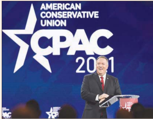
بومبيو لدى لقائه كلمة في مؤتمر المحافظين في فلوريدا

هو أنني لم أعد دبلوماسياً، ولدي الحرية في قول ما أريد. كم منكم يتذكر قاسم سليمان... لم يسبب المقابح للاميركيين مرة أخرى».