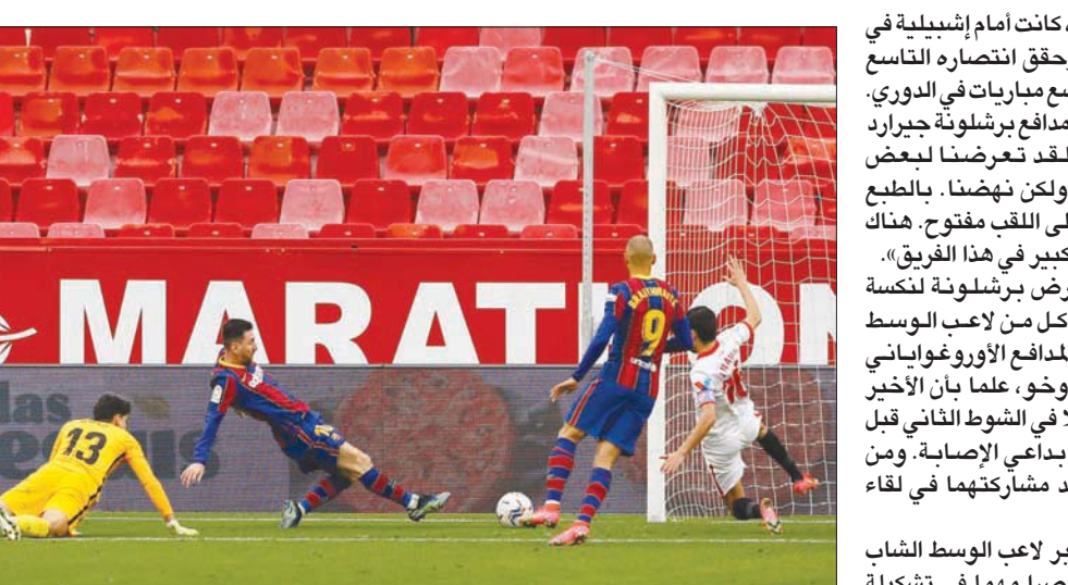
ميسي (الثاني من اليسار) يسجل في مرمى إشبيلية

يعوض ويفتح التسجيل تمريرة من ميسي في العمق انطلاقاً منها دييمبيلي بين المدافعين وسدد زاحفة بيسراه على يسار بونو. وكانت هذه المرة الثانية فقط التي تهتئ فيها شباك إشبيلية في ست مباريات. وأنتهى أصحاب الأرض الشوط الأول من دون أي تسديدة على مرمى برشلونة، بل انظر فريق المدرب خولن لوينغي في الدقيقة 51 ليسدد أول مرة عبر خيسوس نافاس إلا أن الحارس الألماني مارك - أندريه تير شتيغن تصدى للمحاولة. وأنتجت فرصتان محققتان لبرشلونة بتسديدة من الأميركي سيرجينيو ديست وآخرى من ميسي قبل أن يحسم الأرجنتيني الفوز بهدف ثان عندما تلقى كرة على مشارف المنطقة من بيدري إيلياكس موريبا، فتوغل مرادفاً الدفاع وحاول إسقاط الكرة فوق الحارس بونو إلا أنها اصطدمت