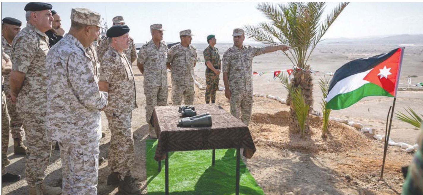
الملك عبد الله الثاني في زيارة لمنطقة الغمر نوفمبر 2019 بعد إنهاء اتفاق تأجير المنطقة لإسرائيل

ويوجد سلام بين الأردن وإسرائيل منذ 1994 وترابطهما علاقات دبلوماسية كاملة.