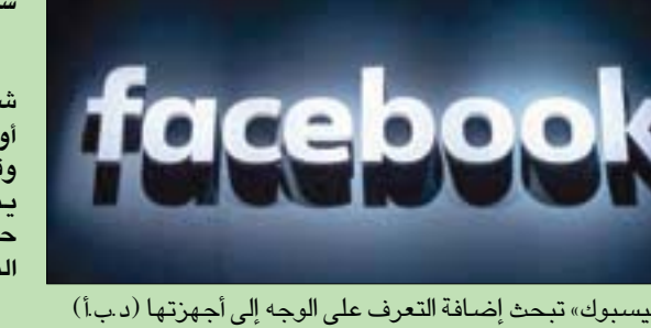
«فيسبوك» تبحث إضافة التعرف على الوجه إلى أجهزتها (د.ب.أ)

نيوز»، المختص في موضوعات التكنولوجيا، عن مصادر تكشفها بالمطلعة، القول إن «أندرو (بوز) بوسورت، المسؤول عن قطاع تكنولوجيا الواقع المعزز والواقع الافتراضي في (فيسبوك)، أبلغ العاملين في الشركة بأنها تدرس حالياً الجوانب القانونية وتلك المتعلقة بحماية الخصوصية المرتبطة