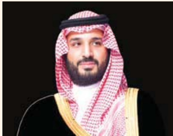
الرياض: «الشرق الأوسط» تلقى الأمير محمد بن سلمان بن عبد العزيز ولي العهد نائب رئيس مجلس الوزراء وزير الدفاع السعودي، أمس اتصالين هاتفيين، من أمير قطر الشيخ تميم بن حمد آل ثاني، وولي عهد الكويت الشيخ مشعل الأحمد