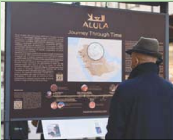
لمحات من العلال بعدسة المصور روبرت بوليدوري (الشرق الأوسط)

رئيس إدارة الوجهات السياحية والتسويق في الهيئة الملكية لمحافظة العلال، هناك روابط قوية تاريخياً وثقافياً بين إيطاليا، والمعرض فرصة أمام الإيطاليين لاستكشاف العلال قبل زيارتها، وفيما يتعلق بتجربته في