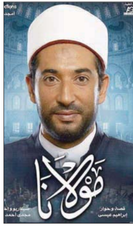
بوستر فيلم «مولانا» (صفحة المخرج على فيسبوك)