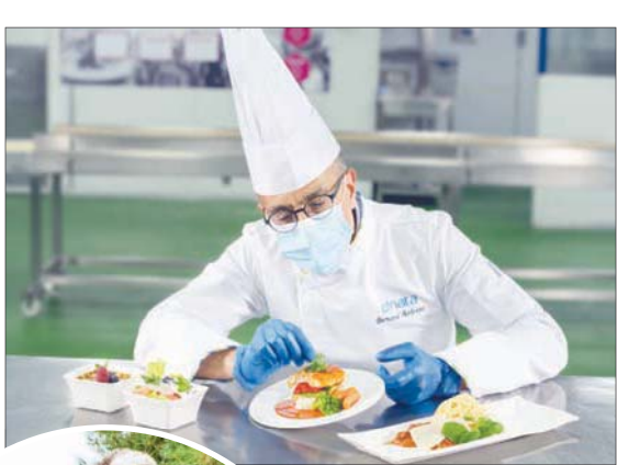
«نانتا» للمتموين من أولى الشركات العالمية في تبنّي إرشادات السلامة الجديدة