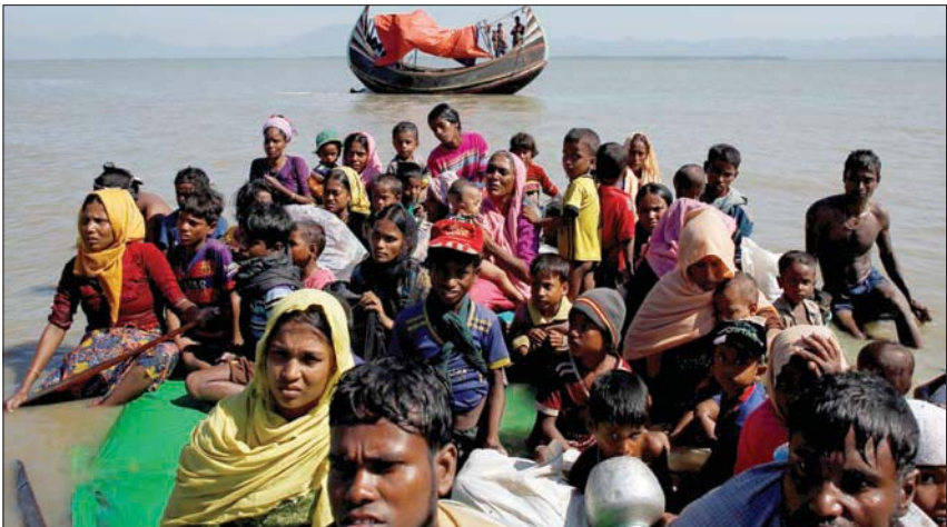
بنغلاديش ترفض إعادتهم إليها وتقول إن المسؤولية تقع على عاتق الهند أو ميانمار (رويترز)

وكان العديد من الناجين، وفقاً لمسؤولين هنود، في حالة إعياء ويعانون من الجفاف الشديد بعد أن نعد الطعام والماء إثر تعطيل محرك القارب بعد أربعة أيام من بدء رحلتهم. وتساءل عبد المؤمن: «هل تعهدت بنغلاديش بالترام عالمي وتحمّل المسؤولية عن استئصال جمع الروهينغا أو راكبي القوارب القادمين من أنحاء العالم؟». وأردف قائلاً: «لا، على الإطلاق». وأضاف أن على مفوضية الأمم المتحدة السامية لشؤون اللاجئين تحمل المسؤولية لأن حوالي 47 لاجئاً من ميث هذا القارب يحملون بطاقات هوية من مكتب المفوضية في بنغلاديش تفيد بأنهم مواطنون نازحون من ميانمار.