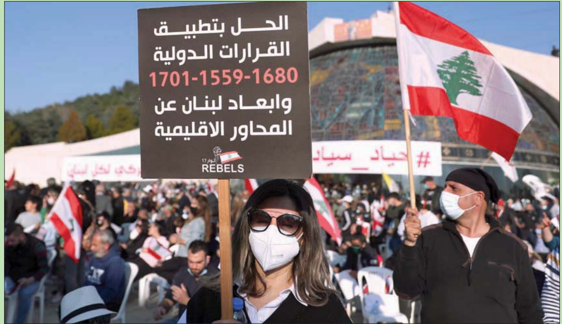
جانب من الحشود التي توافدت أمس على بكركي تضامناً مع دعوة البطريرك الماروني بشاره الراعي إلى «حياد لبنان»

الحل بتطبيق القرارات الدولية 1701-1559-1680 وإبعاد لبنان عن المحاور الإقليمية