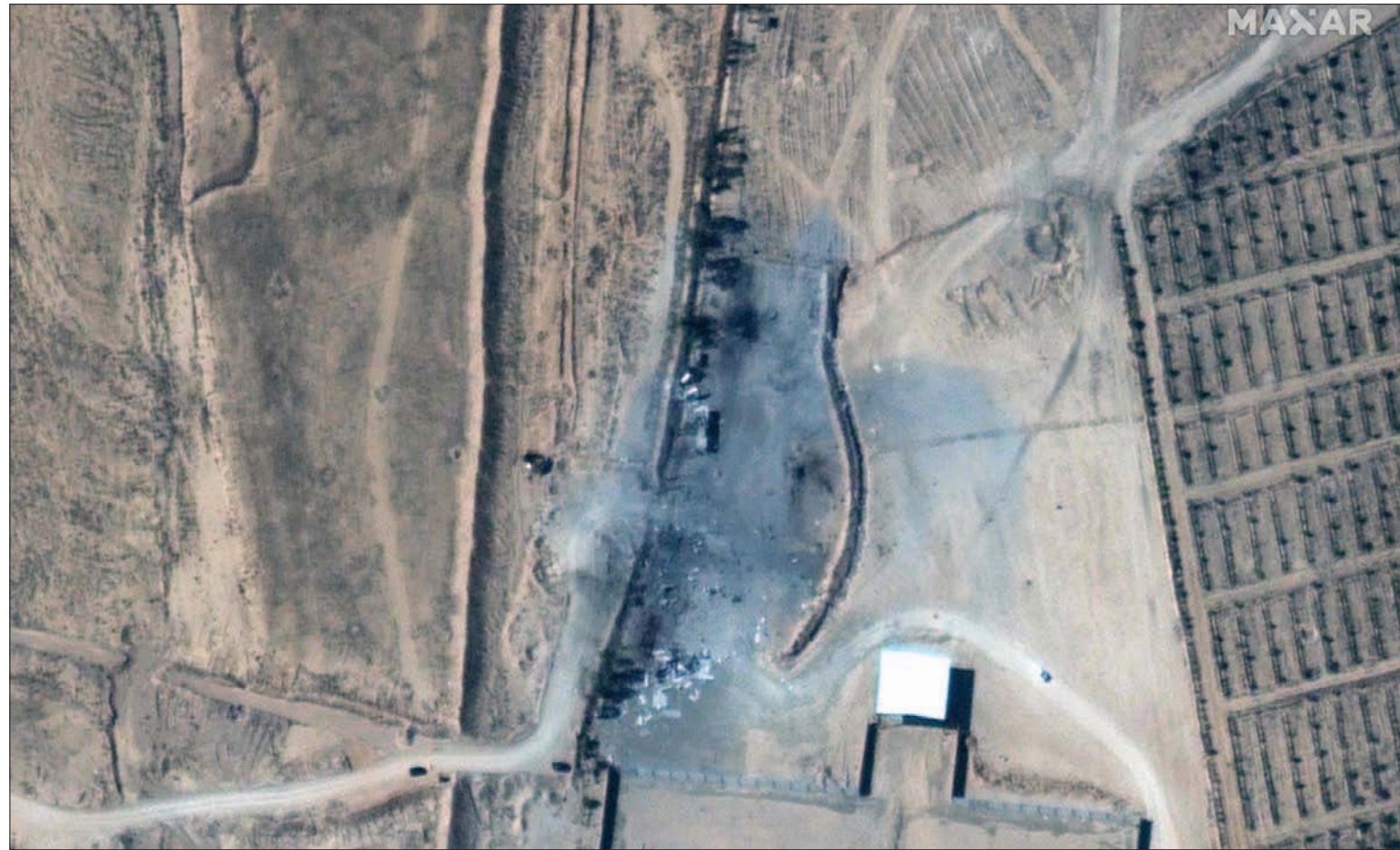
صورة من الأقمار الصناعية لأبنية على حدود سوريا والعراق بعد القصف الأميركي

في سياق متصل، أعلنت وزارة النفط في دمشق تعرض خط غاز الجبسة - الريان لاعتداء في منطقة أبو خشب بريف دير الزور واندلاع النيران فيه وذكرت «النفط السورية»، في بيان نشرته وكالة الأنباء السورية الرسمية (سانا)، أن «الاعتداء وقع في منطقة أبو خشب بريف دير الزور ما أدى إلى اندلاع النيران في خط الغاز»، دون أي تفاصيل أخرى، في حين أكدت مصادر محلية أن خط الغاز الذي انفجر في منطقة الجبسة على طريق أبو خشب بريف دير الزور الغربي مخصص لنقل الغاز من مبلان نحو باباس الساحلية، ولكنه متوقف عن العمل منذ 10 سنوات.