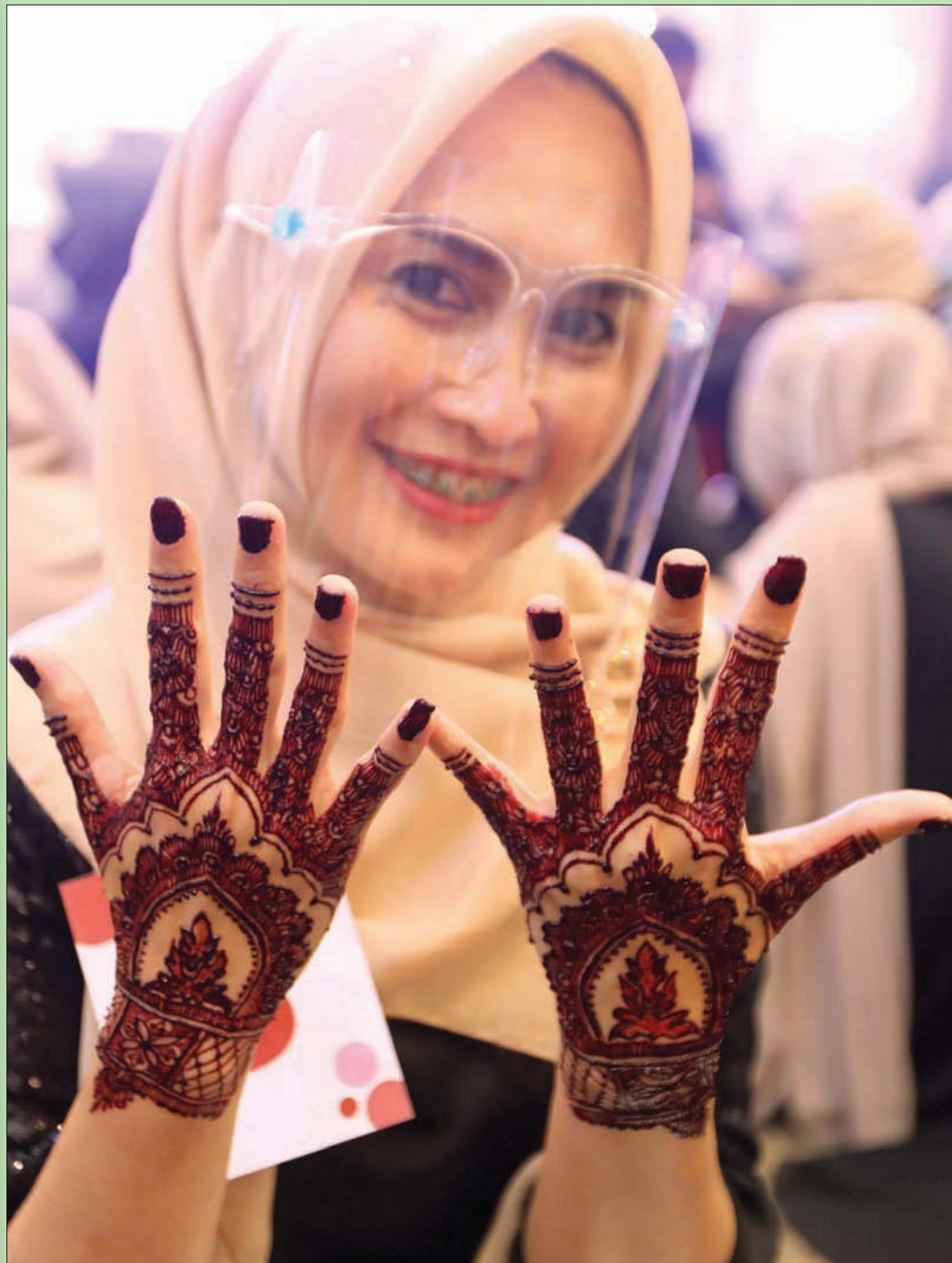
عارضة أزياء تستعرض تصميمها لرسم الحنة خلال مسابقة في باندا تشيشيه بإندونيسيا أمس

كان مرور غورباتشوف في دائرة السلطة الكبرى في هذا العالم، علامة فارقة، في امتلاك أقصى القوة وفي عدم استخدامها.