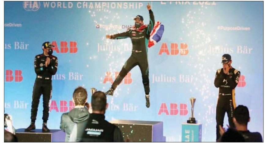
البريطاني فاز بلقب الجولة الثانية وحقق فوزه الثاني في الدرعية بعد لقب سباق الموسم الماضي

تصريحاً من رئيس السباق للمشاركة مجدداً، مضيفاً: في كل مقر صيانة يتواجد شخص