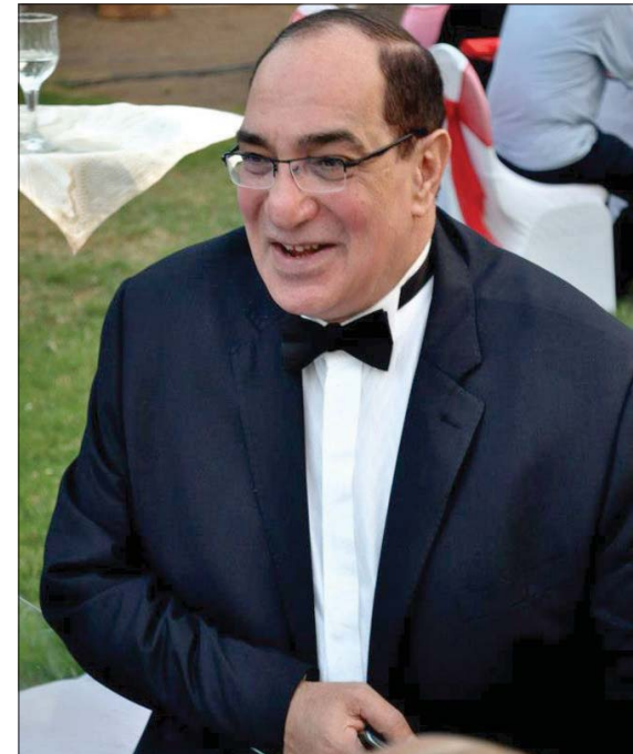
المخرج المصري مجدي أحمد علي

بهذا الزمن، لكن مع ربطه أيضاً بالزمن الحاضر. ويبقى التمويل إحدى الصعوبات، فلم أجد في أي وقت تمويلاً سهلاً، لذا استغرق وقتاً طويلاً بين كل أفلامي.