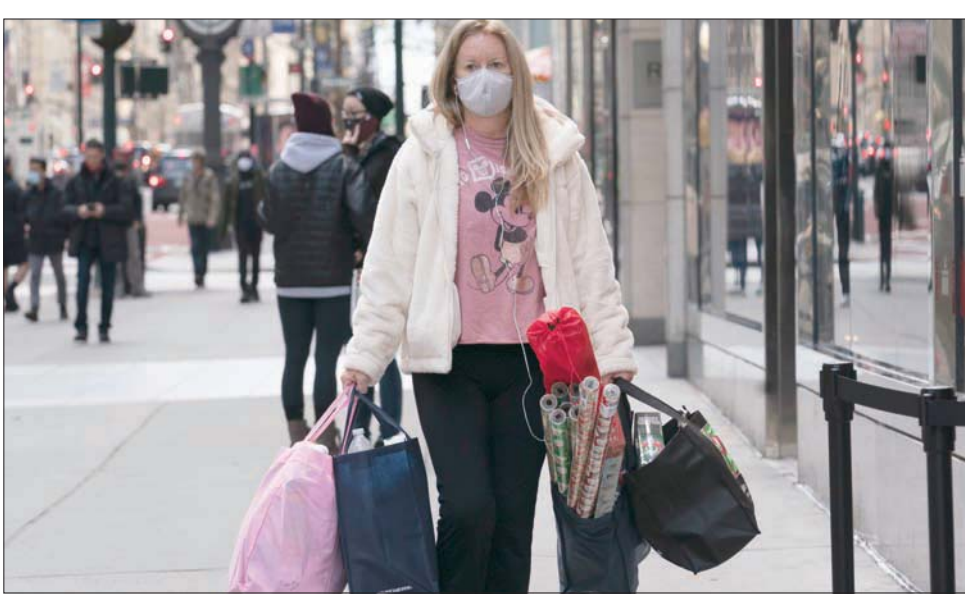
من المتوقع أن يرتفع معدل استهلاك الأميركيين بعد اعتماد خطة التحفيز الأخيرة

المساعدة مقبلة». وعبر الجمهوريون عن الغضب إزاء التكلفة العالية بدرجة غير مسبوقة للخطة، والتصويت عليها بعد منتصف الليل. وقال زعيم الأقلية الجمهورية في مجلس النواب كيفن مكارثي إن «الديمقراطيين يشعرون بحرج إزاء الهدر غير المتعلق بـ(كوفيد) في الخطة إلى درجة أنهم يقومون بحشرها في عز الليل»، ورأى مكارثي أن الخطة «مضخمة»، ومحازبة و«من دون تركيز»، إذ يذهب غالبية التمويل فيها لمشاريع غير متعلقة بشكل مباشر بمكافحة الوباء. والتهم مع زملائه الجمهوريين، الديمقراطيين باستخدام الجائحة لتحقيق مطامح ليبرالية. وأضاف مكارثي أن الخطة «تهدد المال من دون محاسبة»، وفي مجلس الشيوخ الذي يضم 100 عضو، فإن قواعد ما يسمى بالتسوية، تتعلق بقوانين موازنات ويسمح لها بتخطي عرقلة الجمهوريين وإقرارها بغالبية بسيطة، وليس بستين صوتاً، كما في العادة. ورأى النائب أن زيادة الحد الأدنى للأجور لا تتوافق مع المعايير، ونظراً لغياب الدعم الجمهوري لمشروع الخطة في مجلس الشيوخ المنقسم بالتساوي،