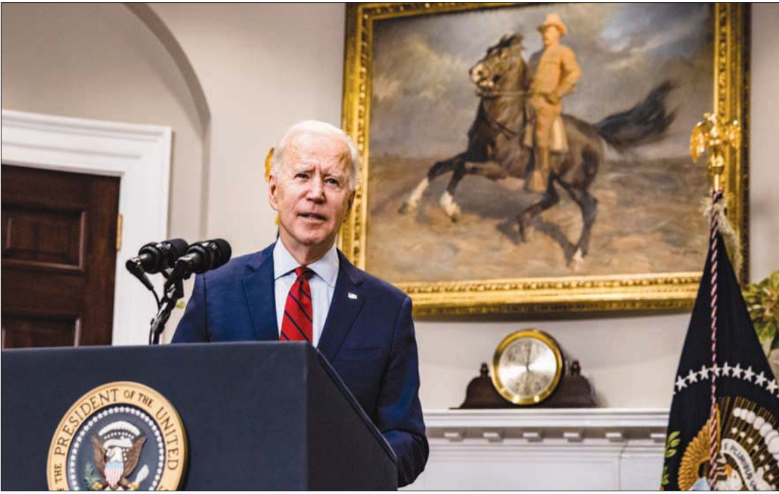
بايدن مخاطباً الأمة بشأن سعيه للحصول على حزمة جديدة للخروج من أزمة كورونا

يتوج الرئيس الأميركي جو بايدن والمكسيكي أندريس بوريول لوبيز أوبرادور، غدا الاثنين، باتصال هاتفي الزيارة الافتراضية التي قام بها وزير الخارجية الأميركي أنطوني بلينكن إلى المكسيك، التي ركزت على الجهود المشتركة في مجال الهجرة وجهود التنمية المشتركة في أميركا الوسطى والتعافي من فيروس «كورونا» والتعاون الاقتصادي. وكان بلينكن قام بهذه الزيارة الرسمية الأولى من نوعها إلى المكسيك بسبب تفشي جائحة «كوفيد 19»، وأجرى محادثات مع نظيره المكسيكي مارسيلو إمبرادور وعدد آخر من المسؤولين في البلد المجاور للولايات المتحدة، وقام بزيارة مشابهة عبر الفيديو إلى كندا، على رغم الأهمية الرمزية لأي زيارة أولى للخارج في الإدارات الأميركية، فإن قرار الرئيس