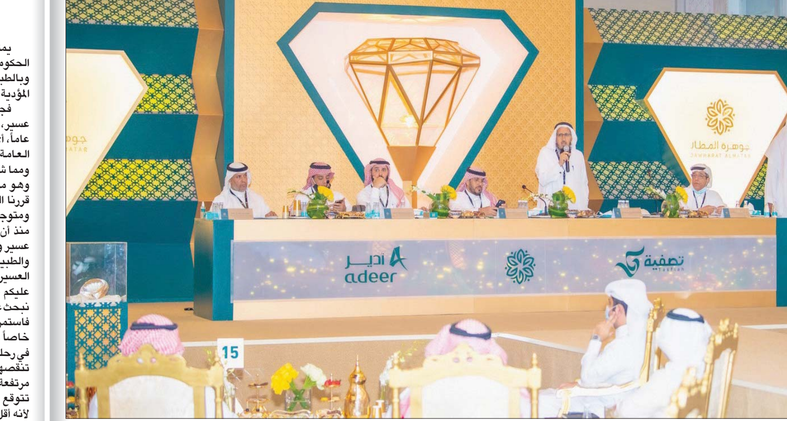
تصفية عدد من المشاريع العقارية خلال العام الماضي عبر البيع بألية المزادات العلنية

اليوم أطلقت السعودية من خلال صندوق الاستثمارات العامة «شركة السودة للتطوير» لجعل المنطقة وجهة سياحية، ولن أتحدث عن فوائد تلك الشركة، ولكن ما استرعاني هو حجم الوظائف التي ستوفرها تلك الشركة، والمحدد بنحو 8000 وظيفة منظورة وغير منظورة، فإذا كنا في السابق نبأخ في حجم الوظائف التي ستوفرها مشاربنا، فإننا اليوم نقل من حجم الوظائف التي سنخلقها مشروع تطوير منطقة عسير، إذا اتوقع أن يخلق المشروع وظائف أكثر من ذلك، خصوصاً الوظائف غير المنظورة، أهمها ارتفاع المنطقة 3000 متر عن سطح البحر، قريبا من تهامة المشفى الطبيعي ومدينة جازان التي تعد مشفى طبيعياً للسياح، ومدينة ساحلية جذابة للسياح، مما يعزز امتداد شركة السودة لتطوير هذه المناطق بصفتها مناطق مساندة لسياحة عسير، ولن أعدد مزايا المنطقة فهي أكثر من أن تحصى، ولكنني متفائل بهذا التطوير. منطقة عسير أهملت سياحياً مدة طويلة، وحينما نقول أهملت فإننا نقصد بذلك أنها لم تأخذ حقها الذي تستحقه، اليوم ومع شركة السودة، بالمنطقة موعودة أن تكون إحدى المحطات السياحية في المنطقة العربية، ولكن يبقى السؤال كم منطقة في عالمنا العربي تمتع بميز نسبية وهي مهملة الآن؟ وتستحق أن ينفخ عنها الغبار لتساهم في الناتج القومي العربي ولتخلق الوظائف، وندمتم.