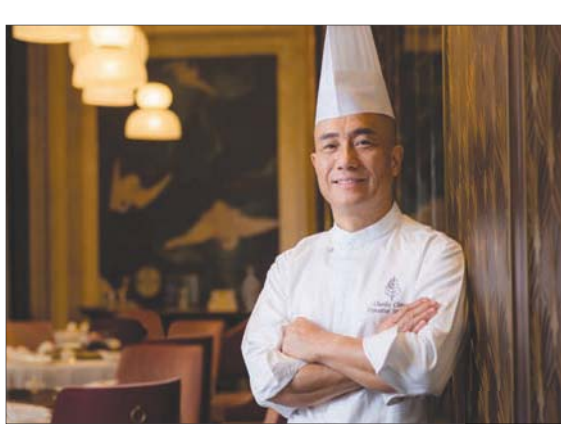
الشيف تشيونغ تشي تشوي في ماكاو