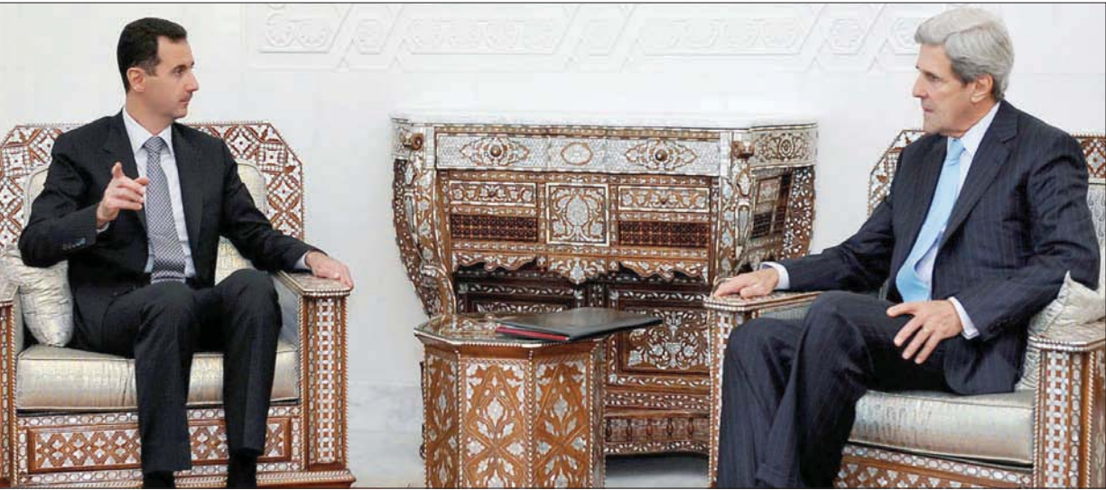
الرئيس بشار الأسد خلال لقائه جون كيري عندما كان رئيساً للجنة الشؤون الخارجية بمجلس الشيوخ الأميركي في 8 نوفمبر 2010.

في فتح سفارات وبوابات حدودية على الخط المفترض له 4 يونيو (حزيران) 1967. وبعد اغتيال رابين في نوفمبر (تشرين الثاني) 1995، حاول بيريز «التخليق في السماء باتفاق سلام مع سوريا»، واستعجل المفاوضات وصولاً إلى معاهدة. وفي بداية 1996، بدأت مفاوضات ثنائية، لكنها انهارت بعد عمليات انتحارية في تل أبيب وعسقلان والقدس. وقتذاك، أبلغ الوند الإسرائيلي نظيره السوري، في جلسة تفاوض بأميركا، أن «إيران تقف وراء الهجمات لأفشل المفاوضات»، وأنه «يجب أن تدين سوريا العمليات الإرهابية»، حسب قول مصدر مطلع. انهارت المفاوضات، وذهب بيريز إلى عملية «عناقيد الغضب» في لبنان التي أخرجته (بيريز) من الحكومة.