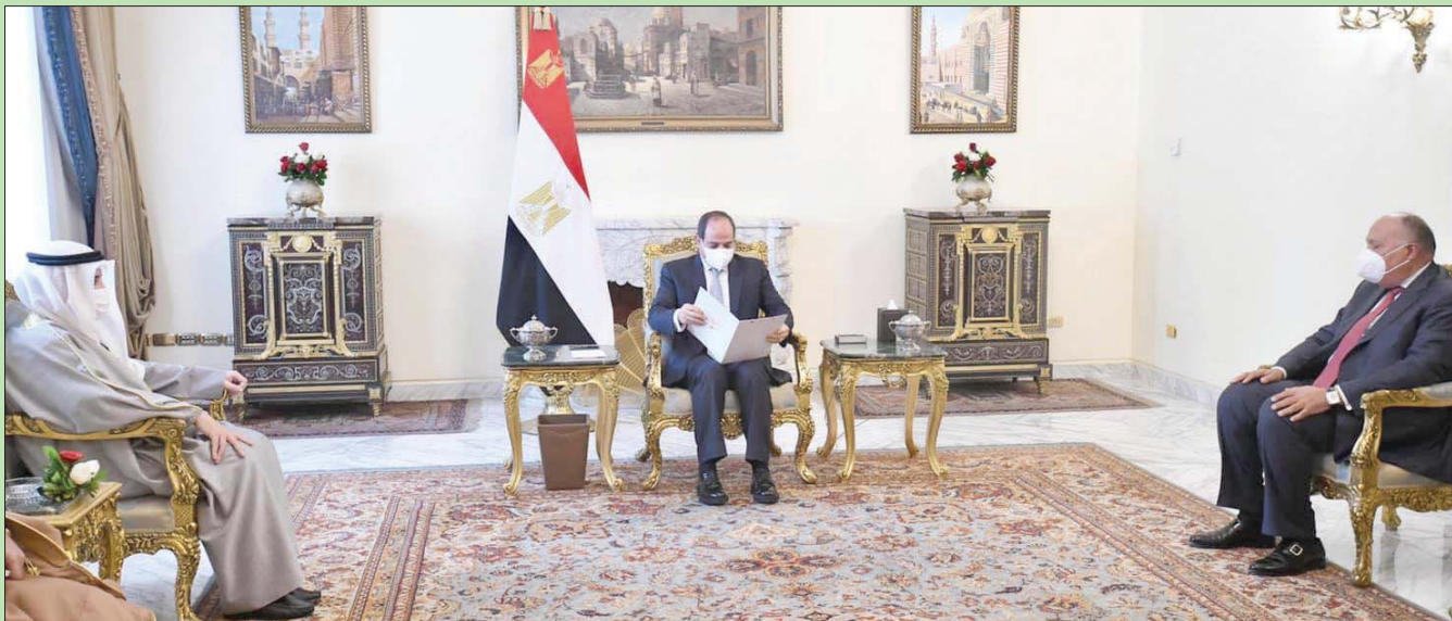
الرئيس المصري لدى استقباله وزير الخارجية الكويتي الذي زار مصر أمس