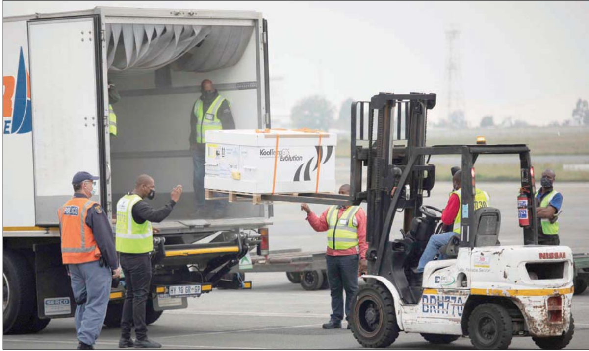
جنوب أفريقيا تستقبل شحنة ثانية أمس من لقاح «جونسون أند جونسون» المكوّن من جرعة واحدة

في التوزيع المنصف للمنتجات الصحية المضادة لـ«كوفيد-19»، كذلك يدعو المجلس إلى «تعزيز المقاربات الوطنية المتعددة الأطراف والتعاون الدولي (... ) بغية تسهيل التوزيع المنصف، وبمكلفة معقولة، للقاحات المضادة لـ«كوفيد-19» (كوفيد-19)». وحالات ما بعد النزاع المسلح والحالات الإنسانية الطارئة والمعقدة، ومن جهة أخرى، يفرض القرار