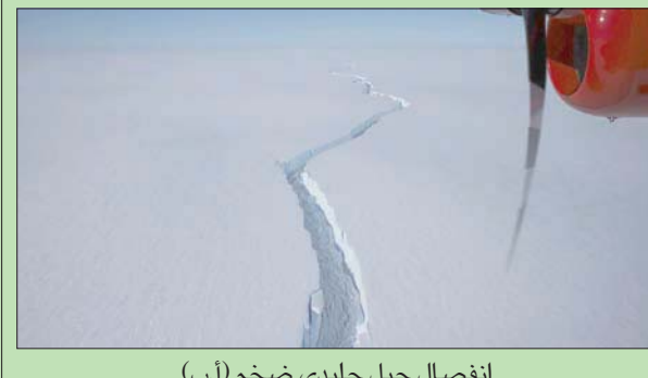
انفصال جبل جليدي ضخم

من أساتذة تربية دينية. وكانت قد بثت قناة التلفزيون العامة «سي واي بي سي» للمرة الأولى الأربعة الأغنية التي تحمل عنوان «إل ديابلو» («الشیطان» بالإسبانية) بصوت المغنية اليونانية إيلينا تسانغرينو. وقد أبلغت القناة العامة الشرطة عن تلقيها اتصالاً من جهة مجهولة