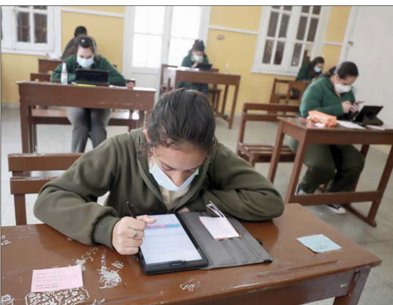
الطلاب يعودون إلى مدارسهم أمس

هالة زايد، أمس، عن «بدء تسجيل الفئات المستحقة من المواطنين للحصول على لقاحات فيروس كورونا المستجد، اليوم (الأحد)، دون السماح بأي مؤانء إطفاء، أو إقامة اعتكاف»، لافتاً إلى «استمرار عدم السماح بفتح الأضرحة، أو دورات المياه، أو دور المناسبات، ومرعاة جميع الضوابط القائمة والالتزام بكل الإجراءات الاحترازية والوقائية». وتكثيف عمليات النظافة وتنظيف وتسجيل بياناتهم، حتى يتم إعطاء الأولوية لتلقيحها، وذلك حسب السن والأمراض المزمنة، كما سيتم إطلاع المواطنين على جميع المعلومات الخاصة باللقاح مثل الاختبارات الخاصة باللقاح ونتائجها، كما يمكن للمواطن الاطلاع على معلومات أكثر تفصيلاً مثل الفئات الأكثر عرضة للإصابة والوثيقة الخاصة بالموافقة المستنيرة لتلقي اللقاح».