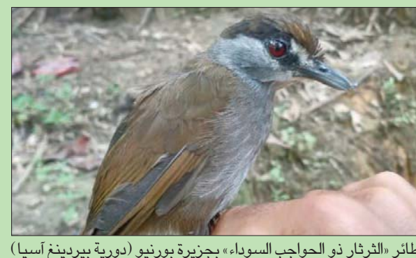
طائر «الثرثار ذو الحواجب السوداء» بجزيرة بروناي

القاهرة، حازم بدر وجد فريق من الباحثين في إندونيسيا وسنغافورة ليلبأ على أن «طائر كان يعتقد لمدة تزيد على 170 عاماً على أنه منقرض، لا يزال حياً إلى الآن». ووصف الباحثون في ورقته المنشورة أول من أمس، في دورية «بيردينغ آسيا» تاريخ الطائر، ولماذا كان يعتقد أنه انقرض؛ وكيف تم العثور عليه في بروناي؛ وهي ثالث أكبر جزيرة في العالم، وأكبر جزيرة