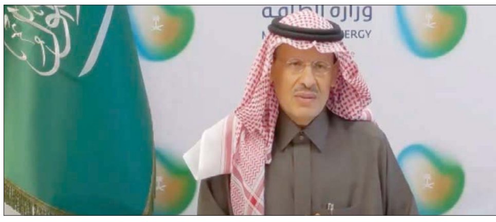
وزير الطاقة السعودي خلال مشاركته في يوم الطاقة والمناخ الذي نظمه منتدى الطاقة والاتحاد الأوروبي

أن الاقتصاد الدائري الكربوني بإمكانه أن يقودنا جميعاً للحد من الانبعاثات وتحقيق الأهداف المرجوة». وقال الأمير عبد العزيز بن سلمان في مشاركته في الفعالية: «لا بد أن نكون مجتمعين على مبدأ أهمية خفض الانبعاثات لمواردنا وقطاعاتنا، وأصبح همتنا وهدفنا المشترك، فإن ذلك سيمكّن الجميع من استخدام وسائلهم وأدواتهم الخاصة في الموارد، وكذلك الرغبة في إنفاق المال لتطوير التقنيات سواء منفردين أو متعاونين، سنكون في وضع أفضل». وزاد وزير الطاقة السعودي: «إذا ما ورغ الأوروبيون وغيرهم الهيدروجين السعودي الأخضر سنكون الاختيار المناسب، لو تسمح اقتصاديات الطاقة لضخها»، مستطرداً: «نحن مؤهلون تاهباً عالمياً لتحويل النفط الخام إلى منتجات عديدة يمكن تحويلها إلى بتروكيماويات ومنتجات أخرى...»