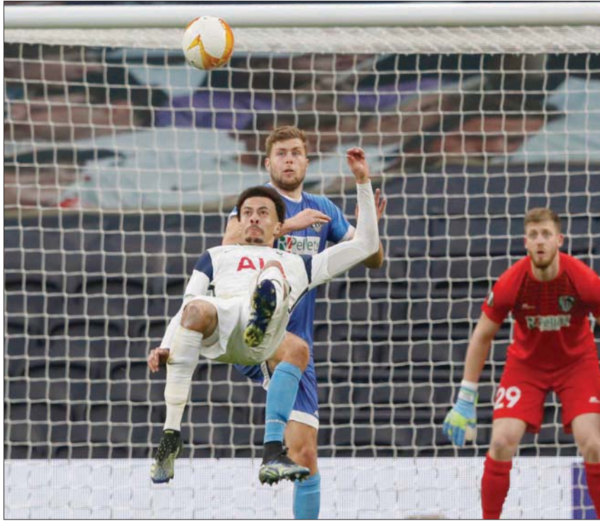
ديلي آلي يفتتح رباعية توتنهام في شباك فولفسبرغر بتسديدة خلفية رائعة

أنتوني مارسيال، مهاجم مانشستر يونايتد، بفترة صعبة أمام المرمى، لكن المدرب أولي غونار سولسكاير عبر عن ثقته بقدرة اللاعب الفرنسي على استعادة تألقه. وتصدر مارسيال هدافي يونايتد برصيد 23 هدفاً في كل المسابقات الموسم الماضي، لكنه سجل سبعة أهداف فقط حتى الآن هذا الموسم. وأخفق اللاعب البالغ من العمر 25 عاماً مرة أخرى في الاستفادة من الفرص التي لاحت له خلال التعادل السلبي مع ريال سوسيداد في الدوري الأوروبي يوم الخميس، لكن سولسكاير عبر عن سعادته بتطور مارسيال في التدريبات مؤخراً. وقال سولسكاير، في مؤتمر صحافي قبل مواجهة تشيلسي اليوم في الدوري الإنجليزي الممتاز: «أعرف أنتوني جيداً ما نريد، ويعمل بكل قوة من أجل الفريق، وهو ما يسعدني كل يوم في التدريبات. لن يركن للراحة في انتظار الحصول