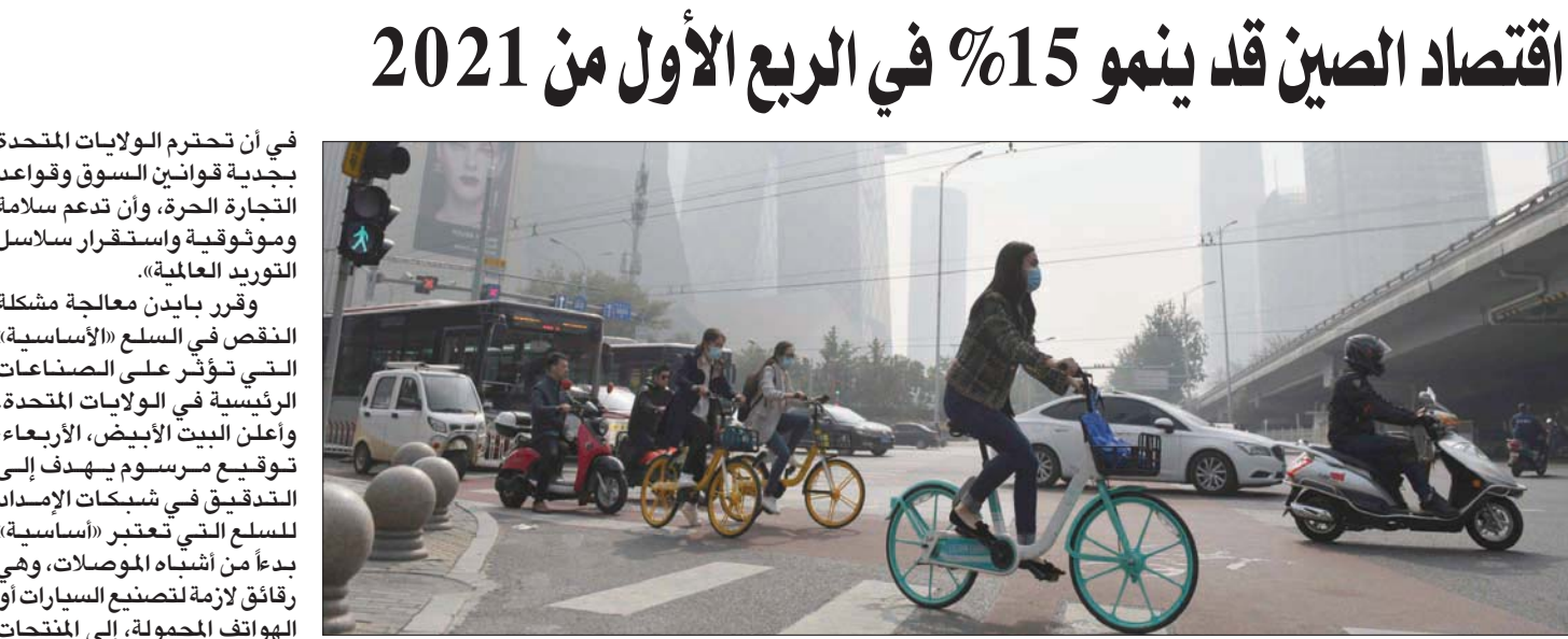
تمكنت الصين التي ظهر فيها الفيروس نهاية 2019 من القضاء على تفشي الوباء وحققت نمواً إيجابياً في 2020

في أن تحترم الولايات المتحدة بجدية قوانين السوق وقواعد التجارة الحرة، وأن تدعم سلامة وموثوقية واستقرار سلاسل التوريد العالمية». وقرر بايدين معالجة مشكلة النقص في السلع «الأساسية» التي تؤثر على الصناعات الرئيسية في الولايات المتحدة، وأعلن البيت الأبيض، الأربعاء، توقيع مرسوم يهدف إلى التدقيق في شبكات الإمداد للسلع التي تعتبر «أساسية» بدءاً من الأشياء الموصلة، وهي رقائق لازمة لتصنيع السيارات أو الهواتف المحمولة، إلى المنتجات الصيدلانية، مروراً بالمعادن المهمة، بما في ذلك تلك الضرورية للتكنولوجيا الحديثة المستخدمة في الهواتف الذكية أو شاشات البلازما. ولم تذكر إدارة بايدين التي تريد خفض اعتماد الولايات المتحدة على الخارج، أي بلد تحديداً، لكن يبدو أنها تستهدف الصين التي تنتج القسم الأكبر من المعادن المهمة. ويندرج هذا الإجراء في إطار المراسيم الموقعة لترويج نمو الصناعات الأميركية. وذكر البيت الأبيض أنه «في السنوات الماضية عانت الأسر والشركات والمعاملون في الولايات المتحدة من نقص في السلع الأساسية والأدوية والأغذية مروراً بالمشروبات الإلكترونية».