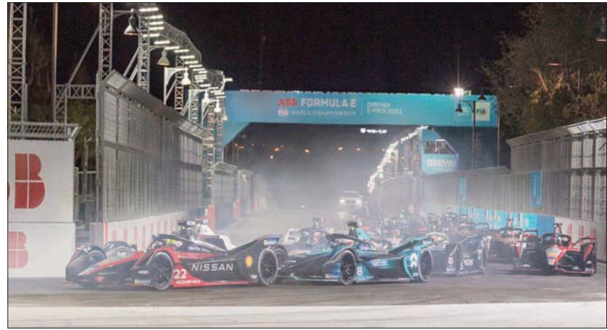
جانب من منافسات سباق «فورمولا إي» الدرعية الذي شهد تنافساً مثيراً بين المتسابقين لحصد لقب الجولة الثانية من السباق العالمي

يُجدر بالذكر أن الجولة الأولى من السباق التي أقيمت في اليوم الأول، توج بها المتسابق الهولندي نيك دي فريز الذي يمثل فريق مرسيدس بنز إي كيو، فيما جاء المتسابق السويسري إدواردو موتارا سائق فريق روكيت فنوتري ريسينغ - موناكو في المركز الثاني، وجاء في المركز الثالث المتسابق النيوزلندي ميتش إيفانز سائق فريق جاغوار ريسينغ البريطاني.