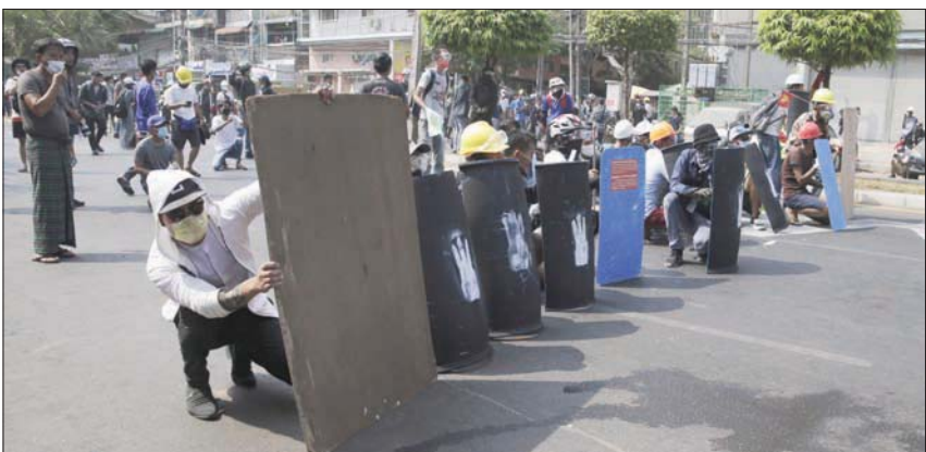
المحتجون في يانغون كبرى مدن ميانمار (أ ب)

هلبدان وميانجون، وهي من نقاط الاحتشاد الرئيسية في يانغون». وأضاف الموقع أن قوات الأمن استهدفت أيضاً الصحافيين الذين يقومون بتغطية المظاهرات في يانغون. دعا سفير ميانمار لدى الأمم المتحدة العالم إلى معارضة الانقلاب العسكري «غير القانوني وغير الدستوري» الذي أطاح بالحكومة المدنية. وعارض السفير كيا موي تون، الذي يمثل الحكومة المنتخبة ديمقراطياً، المجلس العسكري، والقي كلمة لمدة 10 دقائق أمام الجمعية العامة، خطي بعدها بإشادة على «شجاعته وجرأته» من قبل الأمم المتحدة. وقال السفير الذي كان صوته يرتجف في كثير من الأحيان إننا «مارلنا في حاجة إلى أقوى إجراء ممكن من المجتمع الدولي لإنهاء الانقلاب العسكري بشكل فوري، ووقف قمع الأبرياء، وعودة سلطة الدولة إلى الشعب، واستعادة الديمقراطية».