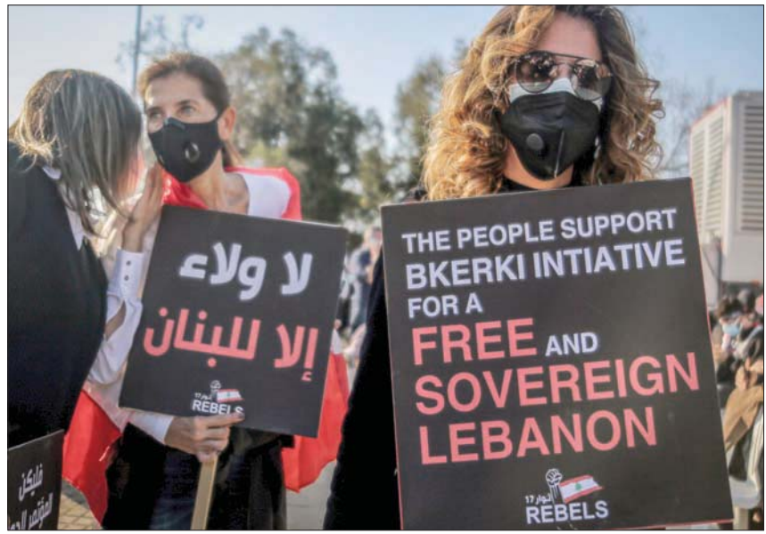
بعض الشعارات التي رفعها المحتشدون في بركي أمس