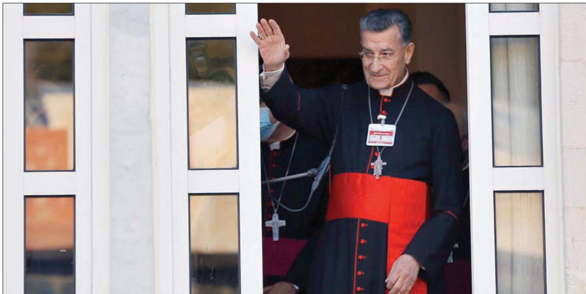
البيتريرك الراعي مخاطباً الحشود التي تجمعت أمام مقره أمس

وحض الراعي اللبنانيين على عدم السكوت «عن الفساد وعن فوضى التحقيق في جريمة انفجار المرفأ، ولا عن السلاح غير الشرعي وغير اللبناني، ولا عن سجن الأبرياء ولا عن التوتين الفلسطيني ودمج النازحين ولا عن مصادرة القرار الوطني ولا عن الانقلاب على الدولة والنظام،