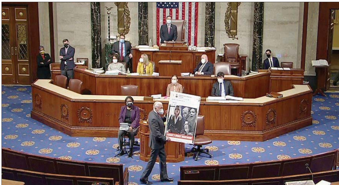
جانب من جلسة سبقت التصويت على طرد نائبة من لجنين في مجلس النواب

وتشاك شومر إلى مناورة تكتيكية عقد من خلالها جلسة ماراثونية لإقرار الموازنة وطرح عدد كبير من التعديلات التي مهدت لتقرير مشروع الإنعاش الاقتصادي لدى طرحه رسمياً في الكونغرس بالأغلبية البسيطة فقط.