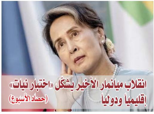
انقلاب ميانمار الأخير يشكل «اختبار نبات» إقليميا ودوليا (حصدا الأسبوع)