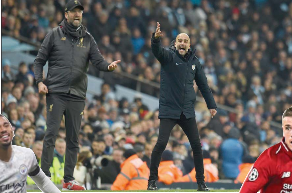
الصدام يتجدد بين الغريمين كلوب وغوارديولا

وقال المدرب المحنك: «هذهنا في نهاية المطاف أن نحزن اللقب. النقاط هي نفسها، لكن هذه المرة أمام منافس (على اللقب)». ويبدو الصراع كبيراً على المركز المؤهلة إلى البطولةين الأوروبيتين، إذ يتتبع ليفربول الرابع (40 نقطة) بفارق