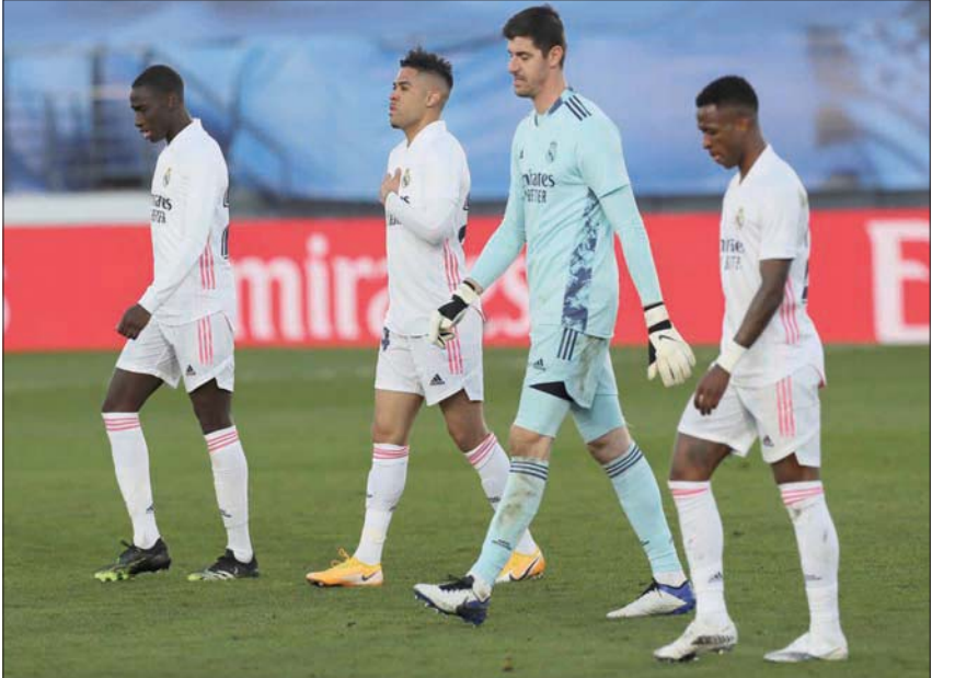
لاعبو ريال مدريد بعد السقوط أمام ليفانتي في المباراة الماضية

مدريد، «الشرق الأوسط» يتطلع نادي ريال مدريد إلى الفوز على هويسكا اليوم في المرحلة الثانية والعشرين من الدوري الإسباني لكرة القدم (الليغا)، سعياً لرجعة من الثقة في ظل تراجع نتائجه في الفترة الأخيرة. وخسر ريال مدريد بقيادة مدربه الفرنسي زين الدين زيدان على ملعبه أمام ليفانتي في المباراة الماضية، ليصبح المدرب في موقف صعب، رغم أن هذا ليس بالشيء الجديد عليه. ويحتل الريال المركز الثالث بجدول الترتيب برصيد 40 نقطة من 20 مباراة بفارق عشر نقاط خلف المتصدر أتلتيكو مدريد الذي خاض مباراة واحدة أكثر من النادي الملكي. وعاد زيدان لارشرف على تدريبات ريال مدريد هذا الأسبوع، وسيكون