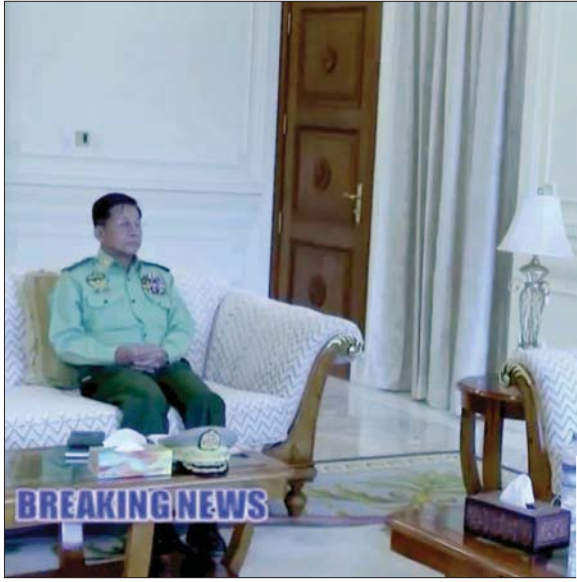
وزير الخارجية الجديد هو وونا مونغ لوين يعلن تسلمه مهامه والجنرال مين أونغ هلاينغ جالساً يصغي للشهادة

ولقد أعرب انطونيو غوتيريش، الأمين العام لمنظمة لإقدام الجيش على اعتقال القادة المدنيين المنتخبين في ميانمار. كذلك، وصفت وسائل الإعلام الأوسع في ميانمار بأنها تعد أول اختبار رئيسي في السياسات الخارجية لفرق الرئيس الأميركي الجديد جو بايدن، ولامر خلفيته العرقية. وفي أوقات أكبر العجازات الماضية لإدارة الرئيس الأسبق باراك أوباما. وكان الرئيس أوباما قد قام بزيارة ميانمار في عام 2012، تلك الزيارة التي تزامنت مع انتخاب الديمقراطي الجديد في البلاد، بتشجيع واضح من الولايات المتحدة، ومع تشكف العلاقات المشتركة مع الكثير من البلدان الديمقراطية الغربية، وتراجع حالة النفوذ الأميركي كانت الحكومة الأميركية قد رفعت العقوبات المفروضة على ميانمار خلال العقد الماضي إثر التقدم الذي أحرزته الحكومة هناك على مسار الديمقراطية، قال الرئيس سوليس، «إن عكس هذا التقدم سيسبب من جانبنا إعادة النظر بصفة فورية في قوانين وصلاحيات العقوبات لدينا، ومن شأن ذلك أن يتبعه اتخاذ إجراءات المناصب». وحقاً، تردت أصداً تعليقاته على نطاق كبير لدى البلدان الديمقراطية الغربية وإن كانت ببعض التغيرات. كما أسفقت تلك التعليقات إلى درجة كبيرة مع تعهد الإدارة الأميركية بتأكيد المسار الديمقراطي لا سيما بعد الاضطرابات السياسية التي شهدتها سنوات حكم الرئيس السابق دونالد ترمب.