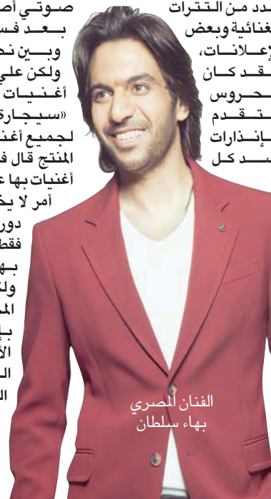
الفنان المصري بهاء سلطان

● ولماذا لم تبادر أنت لقضائه لحفظ «حقوقك»؟ - بييني وبين نصر محروس عشرة عمر، ونعمل معاً لأكثر من 15 عاماً بشكل يومي، وأنا لست من هواة المشكلات، ولت أحب الدخول إلى ساحات القضاء والمحاكم، وكنت أود أن يتم حل