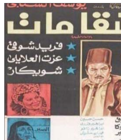
أفيس فيلم «السقا مات»

الشخصية التي عدها الفنان الراحل من أصعب الأدوار التي لعبها في حياته، كما تكررت لقائه مع