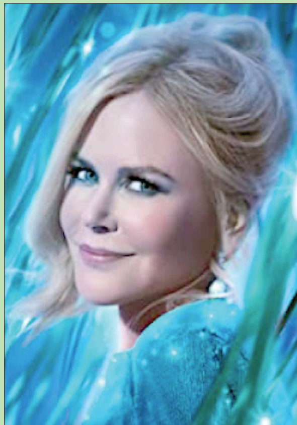
نيكول كيدمان كما تبدو في «حفل التخرج»

هل هذا هو السبب الذي ذكرته ذات مرة عندما قلت لي إنك تؤمنين بالعلم الجماعي؟ -تماماً. النرجسية مدمرة، خصوصاً إذا ما مارسها الممثل؛ لذلك دائماً ما أحب أن أجد نفسي في وسط المجموعة التي أعمل معها وعلى مسافة قريبة واحدة من الجميع. تتخفف أن الحياة ليست العمل الذي تؤديه ليس أنت، بل أنت في الحياة، وأنت في العمل، والكل في منهج مشترك واحد. الممثل أكثر من سواه عليه أن يعرف كيف يندمج في المجتمع. أنا امرأة حميمية وعاطفية، وأحب كثيراً أجواء