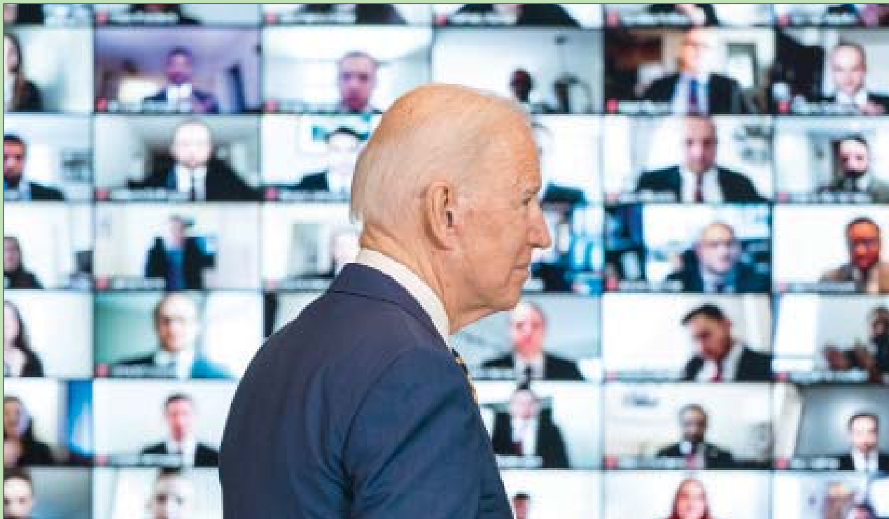
الرئيس الأمريكي جو بايدن لدى إعلانه سياسته الخارجية أول من أمس

زيمرمان، الباحثة السياسية في مشروع «التهديدات الحرجة»، أنه يجب على إدارة بايدن رسم مسار جديد لها في اليمن، بعيداً عن السياسات القديمة في عهد الرئيس أوباما وترمب، وهذا يعني استعادة الدور القيادي لتأمين المصالح الأميركية، بهزيمة تهديد القاعدة، والحد من النفوذ الإيراني، وتحقيق الاستقرار في المنطقة، ومعالجة الظروف الإنسانية.