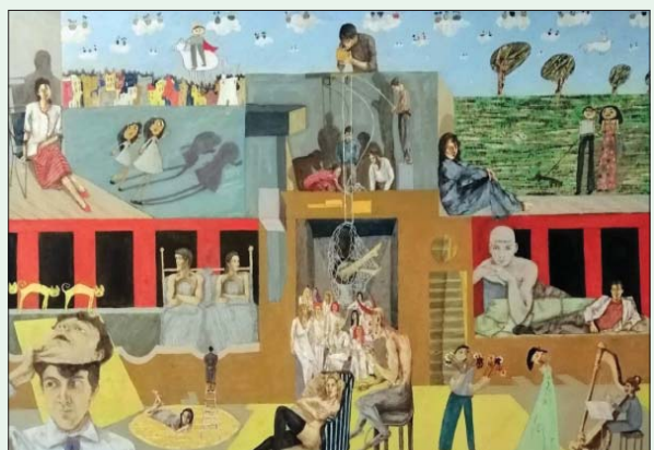
لوحة «حكايا» للفنان صلاح بالجاب

وعقد معرض «نوافذ تشكيلية» بمناسبة إظهار الجمعية اللببية للفنون التشكيلية، وتخليداً لروح الفنان مرعي التليسي، رئيس الجمعية وأحد مؤسسيها، والذي كانت أعماله متصدرة المعرض، والتليسي، الذي بدأ مشواره في بداية ثمانينات القرن الماضي،