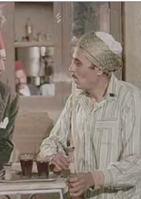
...وفي فيلم «السقا مات»

في مهرجان دبي الدولي للسينما عام 2015 (إ.ب.أ)