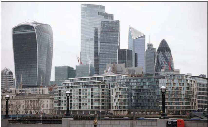
تدعم وزارة التجارة الدولية البريطانية المستثمرين الراغبين في توسيع أعمالهم في المملكة المتحدة

مقارنة بالشهر الماضي بعد تراجع بنسبة 0,6 في المائة خلال الشهر الماضي. في الوقت نفسه زادت أسعار المساكن خلال الشهر الحالي بنسبة 3,3 في المائة سنويا، بعد ارتفاعها بنسبة 6,6 في المائة خلال ديسمبر (كانون الأول) الماضي. وبحسب موقع رايت موف، فإن إتمام عملية بيع المسكن منذ قبول عرض الشراء حتى الانتهاء من الإجراءات القانونية يستغرق 126 يوما وهو ما يعني أن المشتريين الجدد في السوق لن يستفيدوا من تخفيضات بسبب الإغفاء من ضريبة الدمغة إلا إذا كانوا مشتريين لأول مرة.