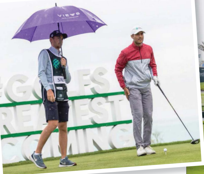
الأمطار أجبرت المنظمين على استكمال جولة التأهل صباح اليوم

وتستكمل منافسات ما تبقى من اليوم الثاني صباح اليوم، قبل أن يتم تحديد المتأهلين الذين سيستكملون منافسات اليوم الثالث من البطولة التي يشارك بها أكثر من 139 لاعباً من مختلف أنحاء العالم، حيث يتنافس جميعهم على لقب البطولة ومجموع جوائزها البالغ 3,5 مليون دولار، والتي تعد إحدى أكبر بطولات الجولف الأوروبية.