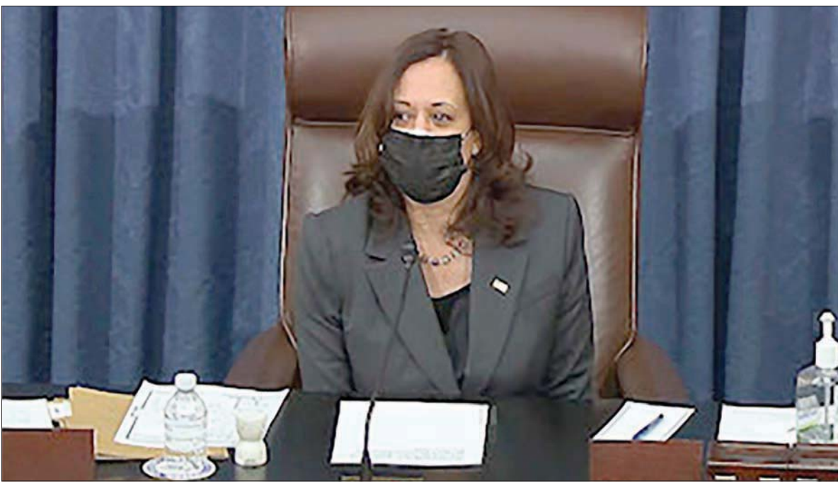
نائبة الرئيس كامالا هاريس رجحت كفة تأييد حزمة الإنقاذ الاقتصادية بتصويتها في مجلس الشيوخ