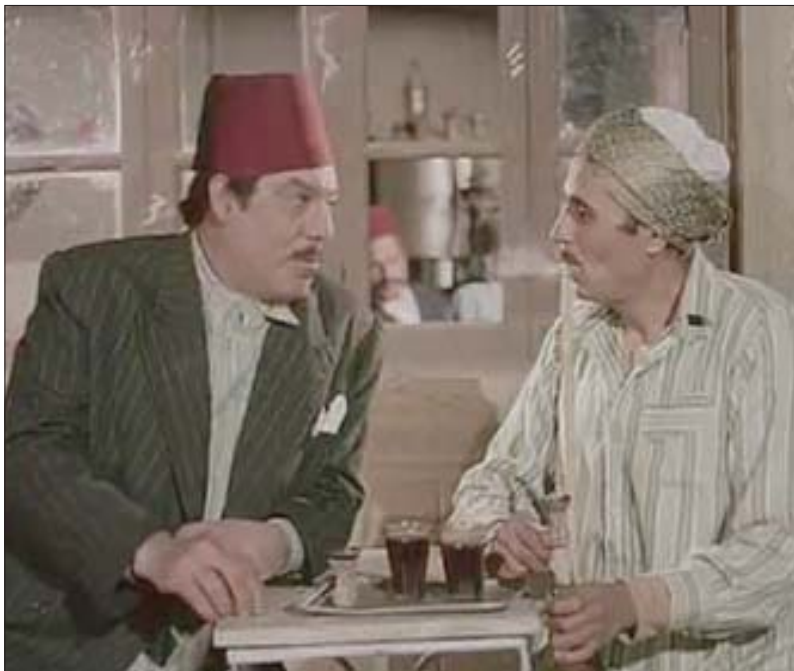
...وفي فيلم «السقا مات»