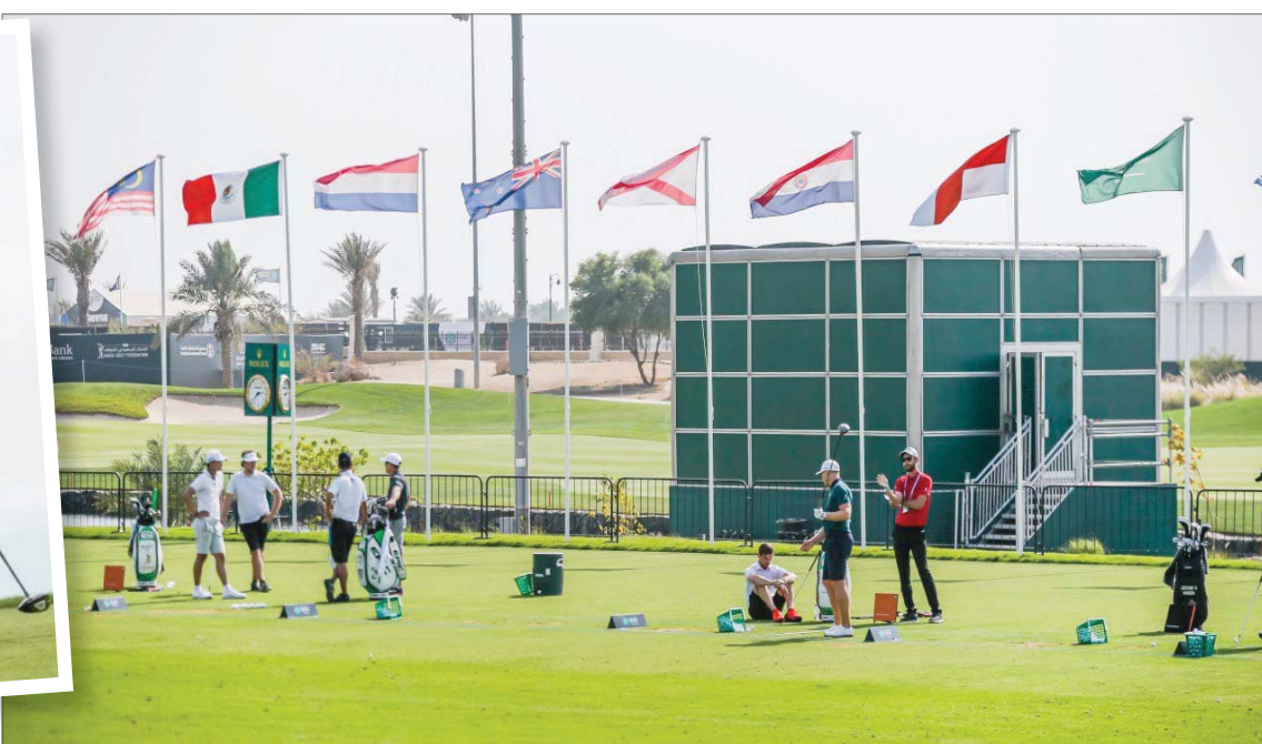
مشاركة عالمية لافتة شهدتها بطولة الغولف الدولية في السعودية

نخبة لاعبي الغولف العالميين تحت ظروف مناخية صعبة بعض الشيء ورغم أنني لم أقم أفضل ما لدي من حيث النتيجة، فإنني خرجت بالعديد من الإيجابيات. عملية التعلم ما زالت مستمرة وفي كل عام أعود بمهارات جديدة وأعمل على تطويرها».