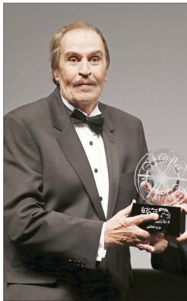
العلابي حصل على جائزة تقديرية عن مجمل أعماله في مهرجان دبي الدولي للسينما عام 2015

الشخصية التي عدها الفنان الراحل من أصعب الأدوار التي لعبها في حياته، كما تكررت لقائه مع