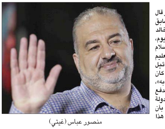
منصور عباس (يغيتي)

تعبه من نضال ودماء ومعاناة، وهنا نقول للسيد منصور عباس ويكل إصرار ويقين، إن هذا نهج خطير ومرفوض ومدان ولن نخجل على أكثر من سبعين عاماً متراكمة من النضال والتضحية».