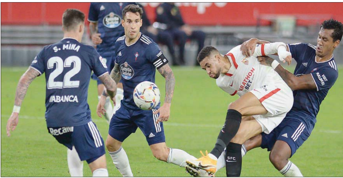
ويحاول التخلص من لاعبي سيلتا فيغو

نهاية المباراة، ظل يكي بشدة. ولم يشارك النصيري سوى مرة واحدة فقط في التشكيلة الأساسية لفريقه في أول 4 مباريات في الدوري الإسباني الممتاز، ولم يشارك في أي مباراة من المباريات الأربع الأولى في أوروبا، ولم يكن ينظر إليه على أنه المهاجم الأساسي لإشبيلية. لكنه شارك في المباراة الأولى ضد ليفانتي في المباراة الثانية، كفت مونشي: «الحياة؛ تقدم دائماً فرصة للانتقام؛ أنت ستحققها». وبدأت الأمور تتغير ببطء وبهدوء، ومن الخطة أن ننظر إلى مونشي على أنه مجرد الرجل الذي يتعاقد مع اللاعبين الجدد؛ فهو أيضاً الرجل الذي يبني بيئة مناسبة تساعد اللاعبين على تحقيق النجاح. كما أن لوبيتيغي من بين المديرين الفنيين اللائق الذين يهتمون بالثقافة ويعملون دائماً على تطوير قدرات وإمكانات اللاعبين، حتى لو كان الجدول المزدحم للمباريات لا يمنحه الوقت الكافي للقيام بهذا العمل كما يريد.