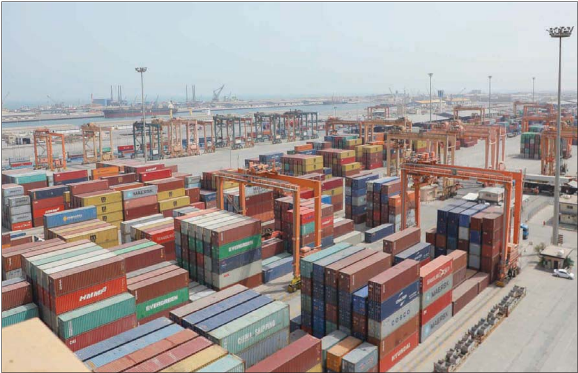
هيئة الجمارك السعودية توسع نشاط تسويق مرافقها للاستثمار المحلي والأجنبي (الشرق الأوسط)