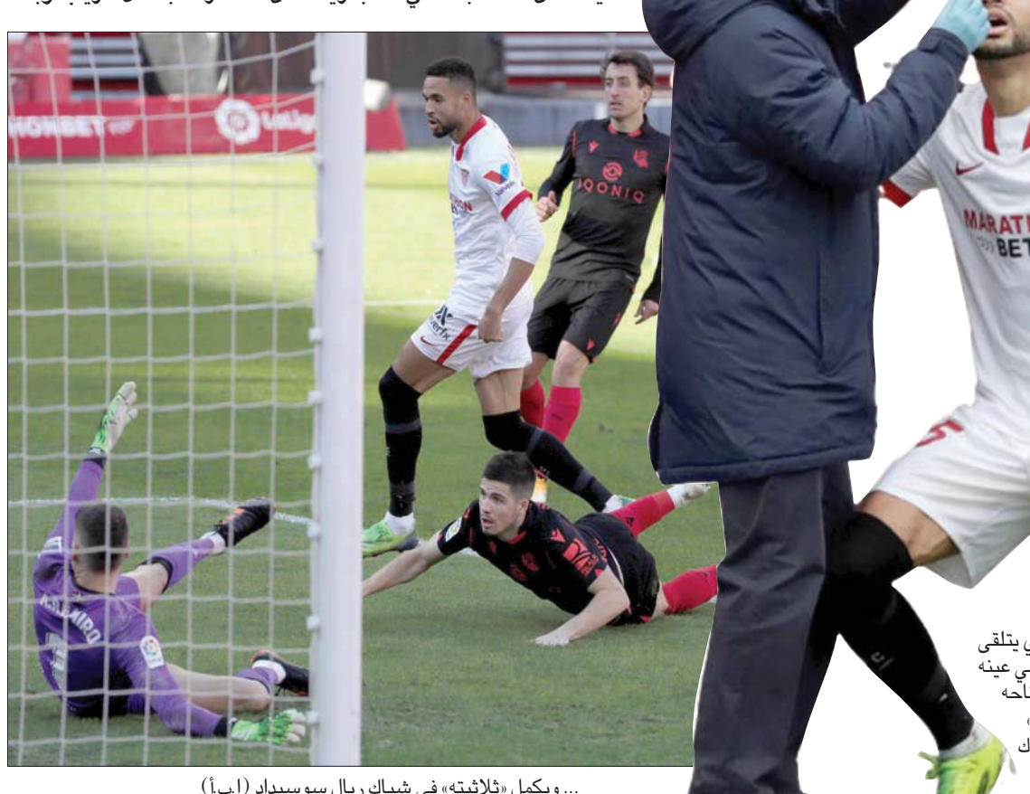
... ويكمل «ثلاثيته» في شبك ريال سوسيداد (إبأ)

النصيري يتلقى علاجاً في عينه بعد افتتاحه «ثلاثيته» في شبك قادش (إبأ)