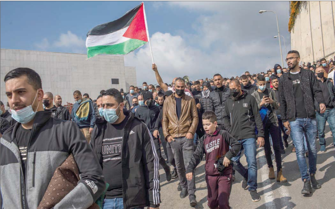
مظاهرات في أم الفحم احتجاجاً على وحشية الشرطة الإسرائيلية ضد العرب