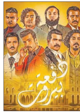
بطاقة من نجوم الخليج والعالم العربي تشارك في مسلسل «دفعه بيروت»