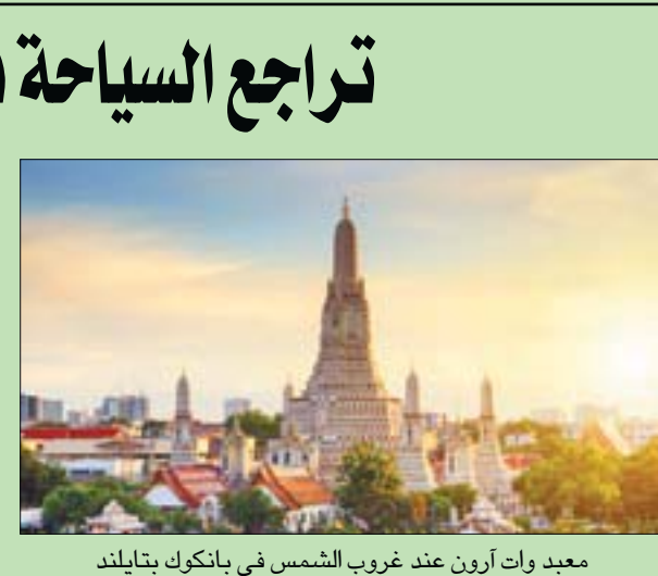
معبد وات أرون عند غروب الشمس في بانكوك بتايلند

الاجانب خلال العام الماضي إلى 6,7 مليون سائح، مقابل 39,9 مليون سائح خلال 2019. وهو أقل رقم تسجله تايلند منذ 2008 على الأقل. وأشارت وكالة بلومبرغ للانباء إلى أنّ إجمالي عدد السياح الذين وصلوا إلى تايلاند خلال ديسمبر (كانون الأول) الماضي، بلغ 6556 سائحاً مقابل 3,95 مليون سائح خلال الشهر نفسه من 2019.