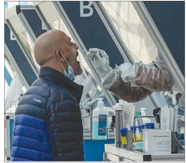
فحص مسافر بمطار «بن غوريون» أمس قبل بدء حظر شبه كامل على السفر

قال وزير الصحة الإسرائيلي، يولي إدلشتاين، أمس (الثنين)، إن هناك أكثر من مليون شخص في إسرائيل حصلوا على جرعتي اللقاح المضاد لوباء «كوفيد-19»، وإن هذا العدد يمثل أكثر من 10 في المائة من سكان البلاد البالغ عددهم 9,2 مليون شخص، حسبما أوردت وكالة الأنباء الألمانية.