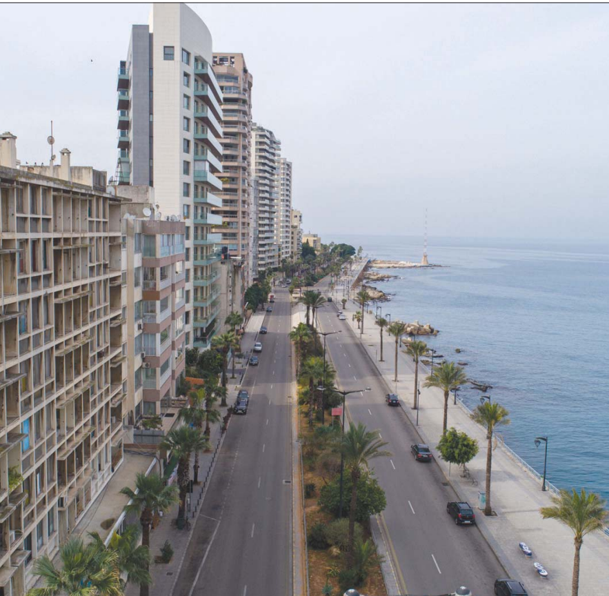
بيروت، الشرق الأوسط

يطلق لبنان اليوم منصة لتسجيل مواعيد الحصول على لقاحات ضد فيروس «كورونا»، تبدأ بالتسجيل حسب القطاعات ووسط أولوية للمعاملن في القطاعات الصحية، في وقت لا تزال أرقام الإصابات تحافظ على وتيرة مرتفعة تفوق الأربعة آلاف إصابة يومية. واستأنف وزير الصحة العامة في حكومة تصريف الأعمال حمد حسن نشاطه في الوزارة بعد تعافيه من فيروس «كورونا»، وعقد اجتماعاً موسعاً تحضيرياً لمرحلة اللقاح، مع ممثلي مجال النقابات المعنية بالقطاعات الصحي والطبي، المدنية والعسكرية، بهدف الاتفاق مع النقابات على حصول تسجيل قطاعي من خلال لوائح تعددها النقابات.