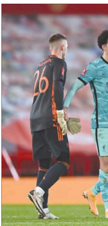
مانشستر يونايتد يعقد جراح ليفربول ويقصيه من كأس إنجلترا

بروميتش يدرك مدى صعوبة مهمة فريقه في مباراة اليوم. وقال الإردايس، «علينا مواجهة الحقائق، لا شك في أن المباراة المقبلة أمام مانشستر سيتي ستكون صعبة للغاية». وأضاف: «هم في أفضل مستويات الدوري الإنجليزي، وسيكون أمراً هائلاً إذا نجحنا في حصد نقطة مثلما فعلنا من قبل على ملعبهم».