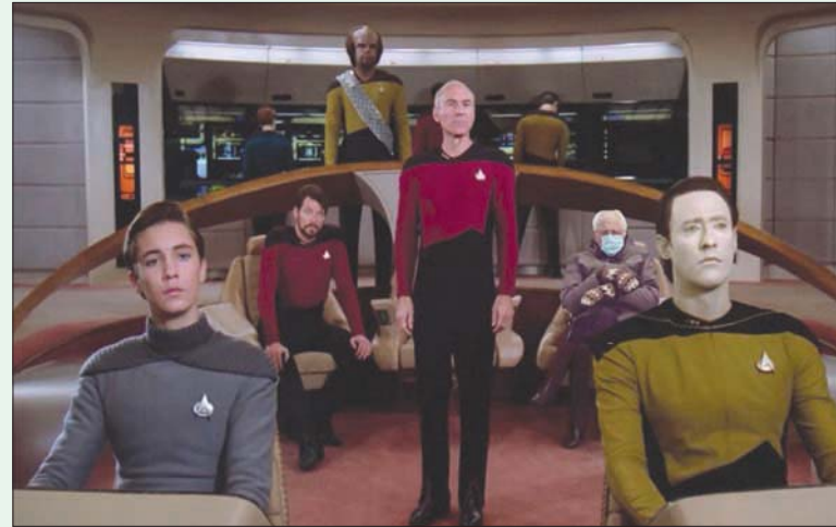
... وفي مسلسل «ستار تريك»

قائلاً «نحن لا نستمتع بتلك المزحة فحسب وإنما نعمل انطلاقاً من ولاية فيرمونت على تحويلها إلى قمصان وملابس للشباب في مختلف أرجاء البلاد، وكل الأموال التي سوف نتمكن من جمعها، والتي أتوقع أن تصل إلى مليونين من الدولارات، سوف تذهب لصالح برامج خيرية من شاكلة (وجبات على العجلات) التي تساعد في إطعام كبار السن من المواطنين ذوي الدخل المنخفض. لذلك، انضح أنه أمر جيد للغاية في واقع الأمر، وليس مثيراً للإمتاع فحسب».