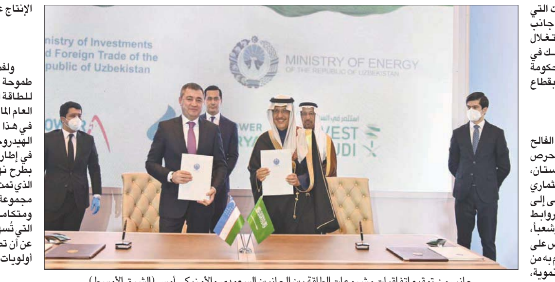
جانب من توقيع اتفاقيات ومشروعات الطاقة بين الجانبين السعودي والأوزبكي أمس