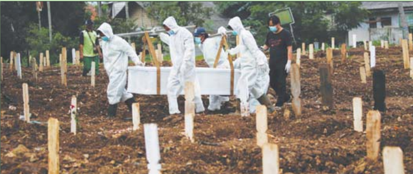
عمال بلدية يحملون نعش متوفى بـ«كورونا» لدفنه في مقبرة بالعاصمة الإندونيسية جاكارتا أمس

عواصم: «التشرق الأوسط» واصل فيروس «كورونا»، أسس، انتشاره السريع حول العالم، مدفوعاً بسلالات جديدة متحورة يبدو أنها أسرع انتشاراً بما يصل إلى 70 في المائة من السلالة الأصلية التي ظهرت للمرة الأولى في ووهان بالصين في ديسمبر (كانون الأول) 2019. وبحلول مساء أمس (الاثنين)، بدأ العالم على عتبة تجاوز رقم 100 مليون إصابة بـ«كورونا»، ما يعني أن الرقم الحقيقي للإصابات بالفيروس يتجاوز هذا الرقم بأضعاف، لأن كثيراً من الدول لا تجري اختبارات واسعة للكشف عن «كوفيد - 19». هوكينز، مساء أمس، بأن إصابات «كورونا» الموثقة رسمياً بلغت 99,346,343 إصابة، في حين وصل إجمالي عدد الوفيات الناتجة عن الفيروس إلى مليونين و132 ألفاً. وتتصدر الولايات المتحدة قائمة «ضحايا الوباء» تليها الهند والبرازيل وروسيا والمملكة المتحدة. وفي ظل مخاوف من الانتشار السريع للسلالات الجديدة المتحورة للوباء، ظهرت أمس، مؤشرات إيجابية إلى أن اللقاحات التي بدأت دول العالم استخدامها بشكل طارئ قد تكون فعالة أيضاً ضد «كورونا المتحور». وقالت شركة «موديرنا» إن لقاحها للوقاية من مرض «كوفيد - 19» أنتج أجساماً مضادة لتحديد الفيروس في تجارب معملية على سلالتين جديدتين من كورونا اكتشفتا في بريطانيا وجنوب أفريقيا، حسب وكالة «رويترز».