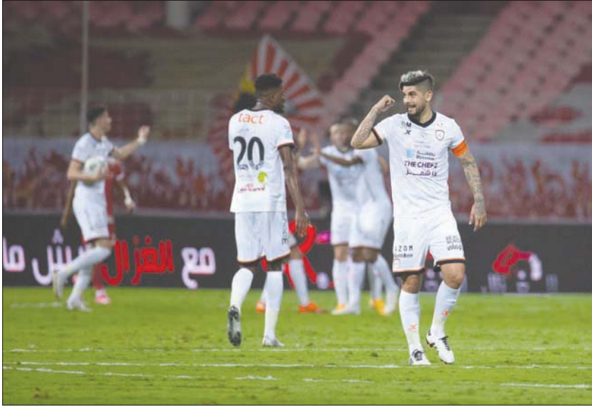
فرحة لاعبي الشباب بأهدافهم الأربعة في شبك الوحدة