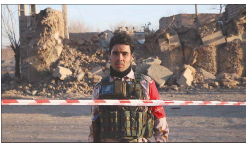
استنفار أمني في هرة عقب تفجير انتحاري الخميس

«طلوع نينو» أن هناك أكثر من 177 حادثاً أمنياً؛ من بينها هجمات انتحارية وتفجيرات بواسطة عبوات ناسفة وجرائم، وقعت في كابل خلال الأيام المائة الماضية، مما أسفر عن مقتل 177 شخصاً وإصابة 360 آخرين. إلى ذلك، ذكرت وزارة الدفاع الإيطالية أن 38 مسلحاً قتلوا في