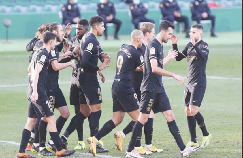
برشلونة من دون ميسي يتخطى إلتشي في المرحلة الأخيرة في «الليغا»

مدرية: «الشرق الأوسط» يخوض إسبيلية اختباراً صعباً عندما يستضيف فالنسيا غداً في دور الستة عشر لمسابقة كأس إسبانيا، فيما يستعد برشلونة قائدته الدولي الأرجنتيني ليونيل ميسي في مباراته ضد ضيفه رايو فايكانو من الدرجة الثانية في اليوم ذاته. في المباراة الأولى، يعني إسبيلية النفس بمواصلة صحوته في الأونة الأخيرة، عندما حقق فوزين متتاليين انتزع بهما المركز الرابع في الدوري الإسباني (الليغا)، في سعيه إلى إنهاء الموسم بين المراكز المؤهلة إلى مسابقة دوري أبطال أوروبا. ويعول الفريق الأندلسي على تائق مهاجمه المغربي يوسف النصيري الذي ضرب بقوة