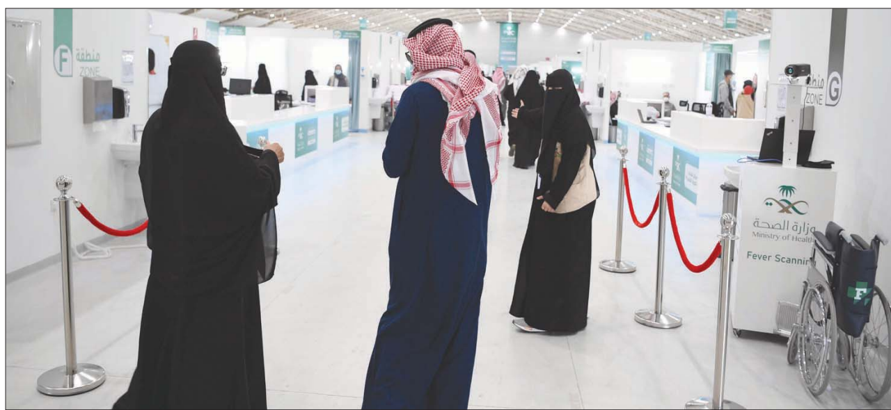
أحد مراكز التلقيح ضد «كورونا» في الرياض

من جهته، أكد المتحدث الرسمي أهمية رفع اليقظة والالتزام بالإجراءات الاحترازية من أفراد المجتمع، بعد أن حققت الجهات المعنية تقدماً ملحوظاً في السيطرة على انتشار الفيروس ويجب المحافظة عليها. وحرصاً على تنفيذ الخطة الاحترازية وضمان منع انتشار الفيروس، وفرت وزارة الصحة الجرعة الثانية للأفراد الذين تلقوا الجرعة الأولى على الرغم من إعلان الشركة المصنعة للقاح تأخرها عن توزيع دفعات جديدة، ومن المنتظر أن تنتهي الدفعة الثانية من المواطنين والمقيمين جرعتهم الثانية اليوم وغداً. وأفاد متحدث الصحة بأن الذين