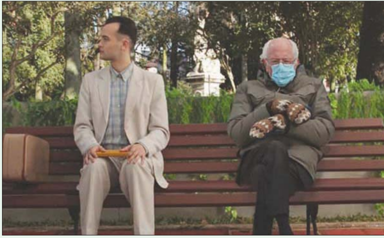
صورة بيرني ساندرز مرتدياً حذاءً من فيلم «فورست غامب»