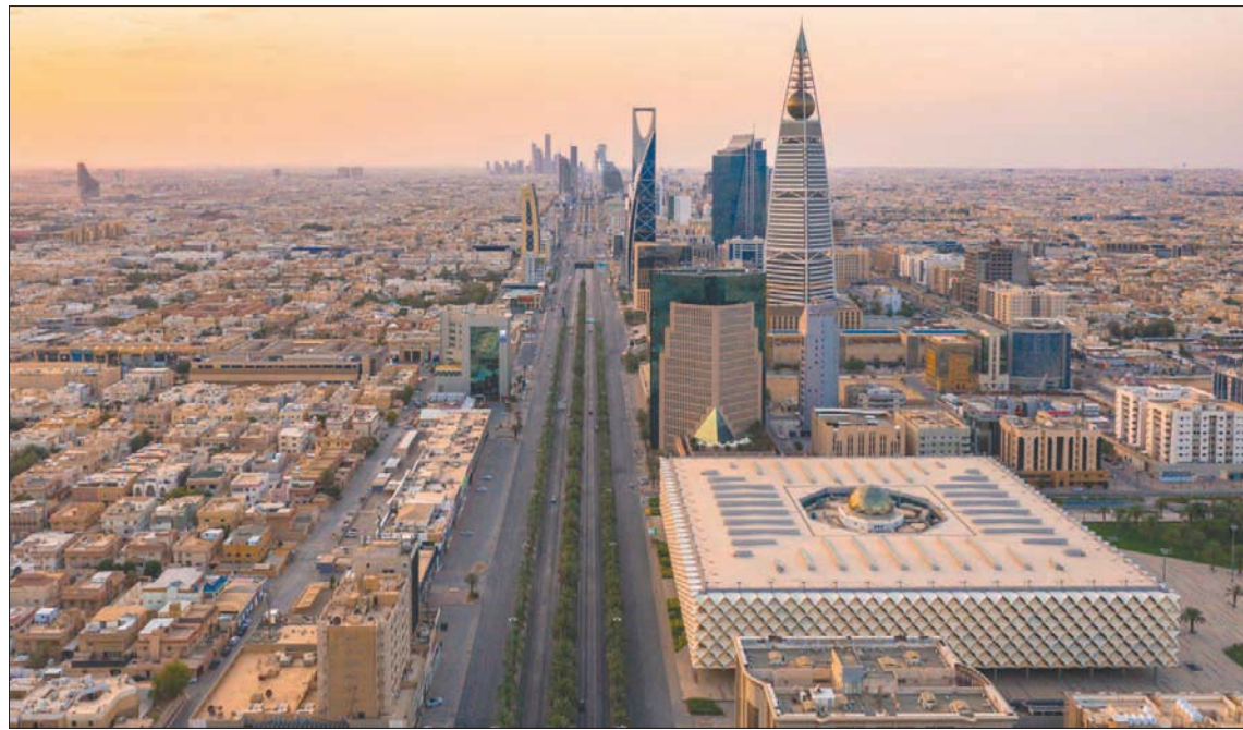
انطلاقة جديدة لمنظومة الاقتصاد السعودي باعتماد استراتيجية صندوق الاستثمارات العامة (الشرق الأوسط)