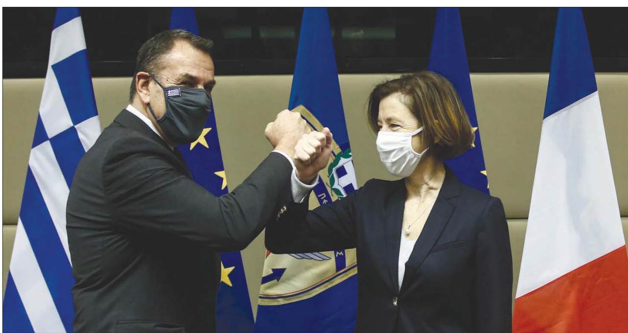
وزيرة الدفاع الفرنسية فلورانس بارلي مع نظيرها اليوناني نيكوس دانيوتوبولوس أمس في أثينا

وقال دبلوماسي لوكالة الصحافة الفرنسية إن «جوزيب بوريل سيتوجه إلى موسكو في مطلع فبراير (شباط) حاملاً رسالة واضحة من الاتحاد الأوروبي، وسيعرض الوضع في روسيا خلال الاجتماع المقبل لوزراء خارجية الاتحاد في 22 فبراير». ويحث وزراء خارجية الاتحاد الأوروبي في اجتماعهم أمس الاثنين في بروكسل، كيفية الرد، بعد حبس المعارض الروسي البارز اليكسي نافالني والاعتقالات الجماعية خلال مظاهرات في أنحاء روسيا، وسط تزايد الذمات لفرض عقوبات جديدة. وقال جوزيب بوريل منسق السياسة الخارجية بالاتحاد الأوروبي للصحافيين: «موجة الاعتقالات هذه أمر يقلقنا كثيراً وكذلك اعتقال نافالني». ووفقاً للنشطاء، تم اعتقال نحو 3500 شخص في عطلة نهاية الأسبوع في إطار أكبر عدد من الاحتجاجات ضد الرئيس الروسي فلاديمير بوتين. وندد وزير الخارجية الألماني هايكو ماس بمعاملة المحتجزين، ودعا إلى الإفراج الفوري عنهم، وذلك في مستهل الاجتماع في بروكسل. وقال: «لكل فرد الحق في إبداء رأيه والتوجه إلى التظاهرات وفق الدستور الروسي... لا بد أن يكون هذا ممكناً». وعاد نافالني، وهو ناشط مناض