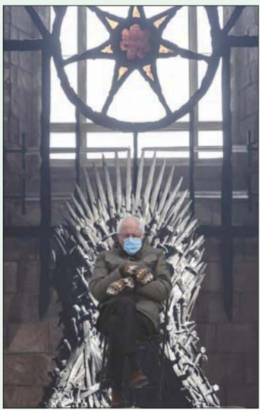
بيرني ساندرز في «لعبة العروش»