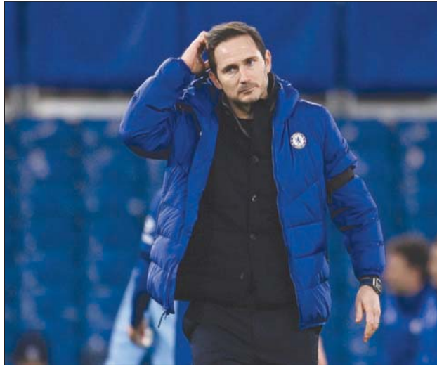
تاريخ لامبارد كلاعب لم يشفع له مدرباً

في الدور الرابع لكأس إنجلترا الأحد وتاهله لدور 16. وقبل الإعلان عن قرار الإقالة نقلت كتب لاعب منتخب إنجلترا السابق غاري لينيكير عبر «تويتر»: «هناك تقارير عن إقالة تشيلسي مدربه فرانك لامبارد اليوم... وهو أمر مؤسف بعد أول تراجع في نتائجهم». وأضاف لينيكير: «كان يفترض منح بعض الوقت بالنظر لوجود لاعبين جدد في بداية مسيرتهم في صفوف ناديهم الجديد. لا أحد يعترف بأهمية الصبر في هذه الرياضة. لا يتعلمون أبداً». ووصف مايكل أوين مهاجم ليفربول ومنتخب إنجلترا السابق قرار الإقالة بأنه «جنوناً» قائلاً: «بالتأكيد قرار تشيلسي بإقالة فرانك لامبارد هو قرار صادم جداً. من أين تريدون أن نبدأ؟ فعكس كل التوقعات قاد الفريق للمربع الذهبي في الموسم الماضي