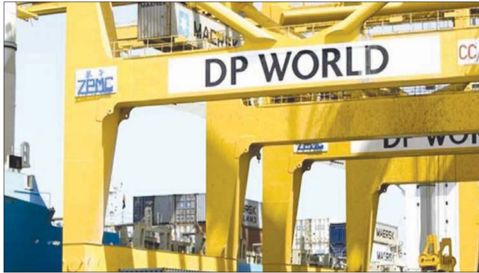
من المتوقع أن تعزز المحطة من وجود «موانئ دبي العالمية» في القارة الأفريقية (الشرق الأوسط)

التي تشمل المحافظة على وظائف العمال في الميناء، وتنفيذ خطط التدريب، وبناء القدرات في مناطق مختلفة من قبل صاحب الامتياز، إضافة إلى إدراج الموظفين الأنغوليين من المستويين المتوسط والعالي في هيكلية صنع القرار، إلى جانب مكاسب أخرى تقدرها تماماً».