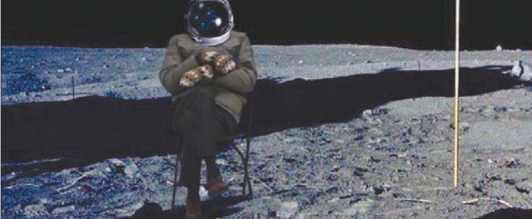
بيرني ساندرز مرتدياً حذاءً من فيلم «فورست غامب»

وقال أحد مستخدمي منصة «تويتر»، «إنني مقتنع بأن السيناتور ساندرز كان سوف يرتدي الملابس نفسها بالطريقة نفسها في مراسم التنصيب لو كان هو الفائز بمنصب رئيس الولايات المتحدة».