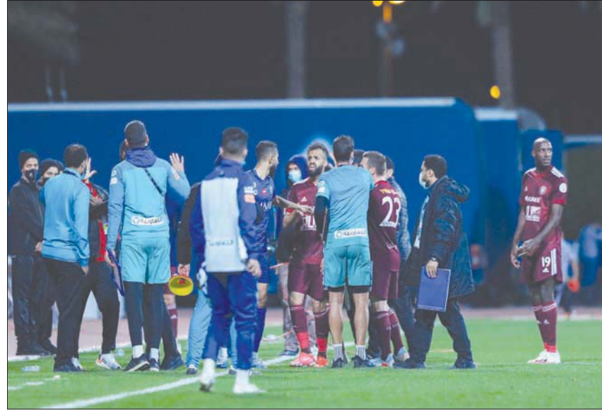
الغضب كان واضحاً في صفوف الهلال بعد التعادل مع الفيصلي

وفي مدينة بريدة، استعاد فريق التعاون نغمة انتصاراته وحقق فوزاً ثميناً وكبيراً من أمام ضيفه فريق ضمك بثلاثة أهداف مقابل هدف في مواجهة شهدت تالفاً كبيراً للكاميروني ليندر تاوامبا الذي وضع بصمته بتسجيل الهاتريك الأول له هذا الموسم في شبك الفريق القادم من الجنوب.