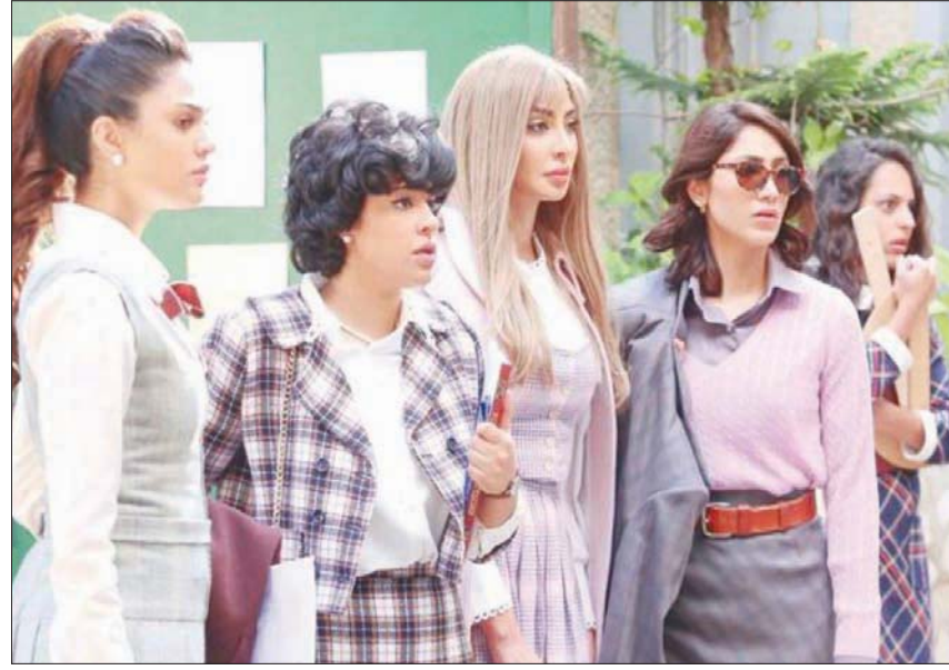
لقطة من إحدى حلقات «دفعه بيروت»

وعلى أنغام أغنية ماجدة الرومي «يا بيروت» تسدل ستارة العمل على مشهد مؤثر وصوت بروي لنا عن بطولة مبارك. «مات مبارك وشيع جثمان الحركة في سياسية ودينية وأضعة أصعبها على جرح بيروت الذي لا يزال ينفذ حتى اليوم. عرفت المشاهد على نقاط تشابه كثيرة تجمعها بالوطن العربي. حزرت العلاقات المرتكزة على الطبقة والعصرية من قوقعتها. عرضت عادات وتقاليد الخبيجة ومن بلاد الشام كمادة