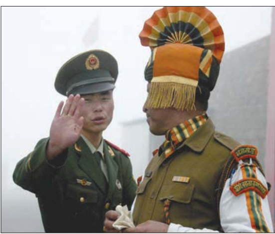
المواجهات تسلط الضوء على الوضع الهش على طول الحدود التي تمتد لمسافة نحو 3800 كيلومتر

لخفض التصعيد بين القيادتين العسكريتين، مما يشير إلى التوتر المتزايد في العلاقات بين البلدين. وكان قادة عسكريين من الهند