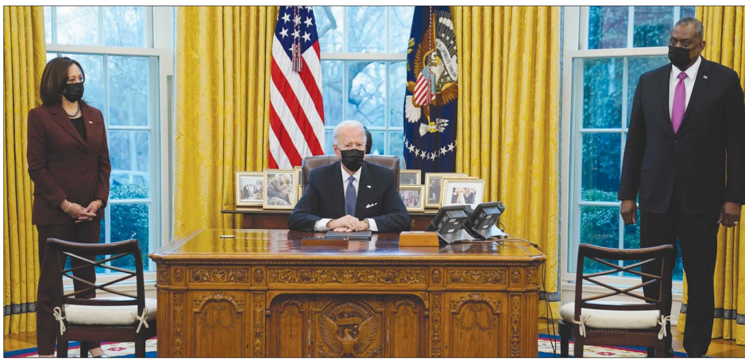
بايدن لدى اجتماعه مع وزيره للدفاع لويد أوستن بحضور نائبة الرئيس كامالا هاريس في البيت الأبيض أمس

وقال قائد «مجموعة التدخل البحرية التاسعة» العبد البحري دوغ فيريسيمو: «أمر عظيم أن نعود إلى بحر الصين الجنوبي للقيام بعمليات روتينية لتشجيع حرية البحار وطمانه حلفائنا وشركائنا». ووصف المتحدث باسم وزارة الخارجية الصينية، أمس، التدريبات العسكرية الأميركية بأنها «عرض قوة لا يشجع السلام والاستقرار في المنطقة». وتشهد المنطقة نزاعات بين الصين وكل من تايوان وماليزيا والفلبين وفيتنام وبروناي، حول السيطرة على جزر فيها. يذكر أن بحر الصين الجنوبي ممر بحري استراتيجي ويعقد أنه يحتوي على احتياطي ضخم من الغاز والنفط. وصدقت الصين في السنوات الأخيرة مطالبته بالسيادة على غالبية بحر الصين الجنوبي، من خلال بناء جزر صناعية مجهزة لاستقبال طائرات حربية، مما أثار غضب الدول الأخرى التي تخوض معها نزاعات. وأكدت واشنطن، أول من أمس، أن الدعم الأميركي لتايوان يبقى «صليبا كالصخر»، رغم «محاولات التهريب» من جانب الصين، في أول موقف يصدر بهذا الصد عن الإدارة الأميركية الجديدة. وانفصلت تايوان عن الصين في نهاية الحرب الأهلية عام 1949، ويعيش سكانها: البالغ عددهم 23 مليون نسمة، تحت تهديد مستمر بغزو من الصين التي تعد الجزيرة جزءاً من أراضيها. ورغم اعترافها بكين رسمياً، فإن واشنطن تبقى أهم حليف غير رسمي وادعم عسكري لتايوان. وتعارض الصين إقامة أي دولة راقمة رسمية مع تايوان، وتحاول إيقاع الجزيرة منزولة دبلوماسياً. وعزز الرئيس الأمريكي السابق دونالد ترمب اتصالاته مع تايبيه خلال مواجهة الدبلوماسية والتجارية مع الصين التي عبرت عن أمهاتها في بداية جديدة بالعلاقات الثنائية خلال عهد بايدن.