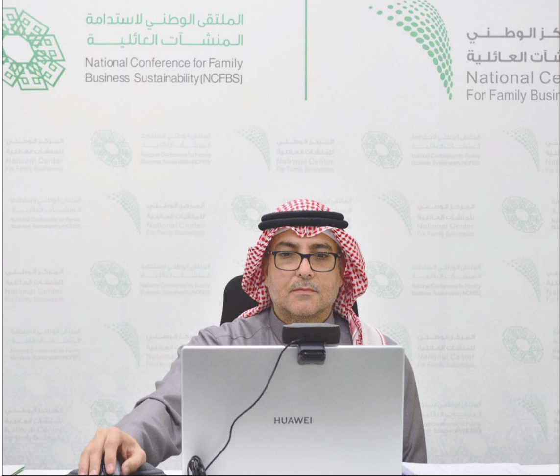
جانب من ملتقى استدامة المنشآت العائلية في السعودية أمس

استدامتها وأثرها الاقتصادي والاجتماعي، مشيراً إلى أن المملكة تستحوذ على نسبة 48 في المائة من إجمالي المنشآت العائلية في الشرق الأوسط، وتساهم هذه المنشآت بـ50 في المائة من الناتج المحلي غير النفطي وتمثل 95 في المائة من عدد المنشآت بالمملكة. ووفق الجيحي، يعمل بالشركات العائلية، أكثر من 80 في المائة من إجمالي العاملين بالقطاع الخاص، مشدداً على ضرورة تعزيز وبناء قدرات المنشآت العائلية وزيادة تأقلمها وتكيفها مع المستجدات والبيئة