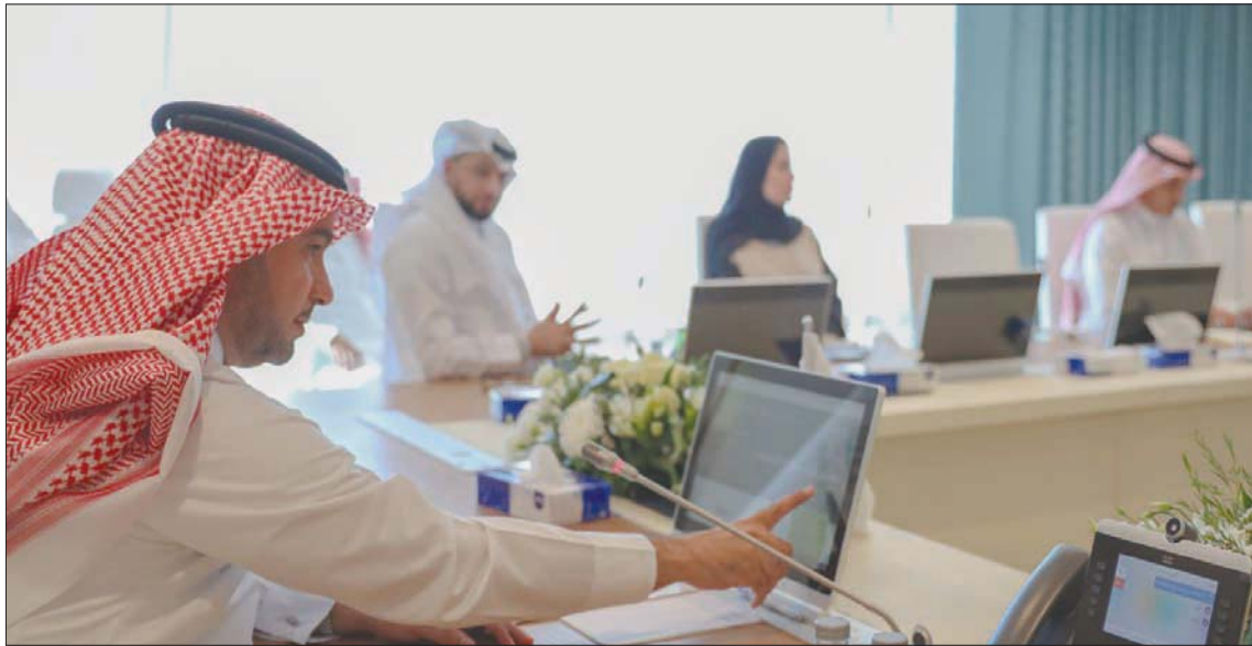
وزارتا «الشؤون البلدية» و«الإسكان» تنضويان تحت وزارة واحدة... وفي الصورة يبدو الوزير ماجد الحقييل (الشرق الأوسط)

ما يلزم بشأنها، لاستكمال الإجراءات النظامية اللازمة. إلى ذلك، قال مروان الشريف، المختص في الشأن المالي، إن قرار خادم الحرمين بضم الوزارتين سيسهم بشكل كبير في تحقيق «رؤية المملكة 2030» التي تعتمد على جملة من برامج التحول الوطني وتحقيق التوازن المالي وجودة الحياة وبرنامج الإسكان الذي تهتم به الدولة ونجحت فيه وزارة الإسكان في تقليص الفجوة وتمكين السعوديين في إيجاد المسكن المناسب.