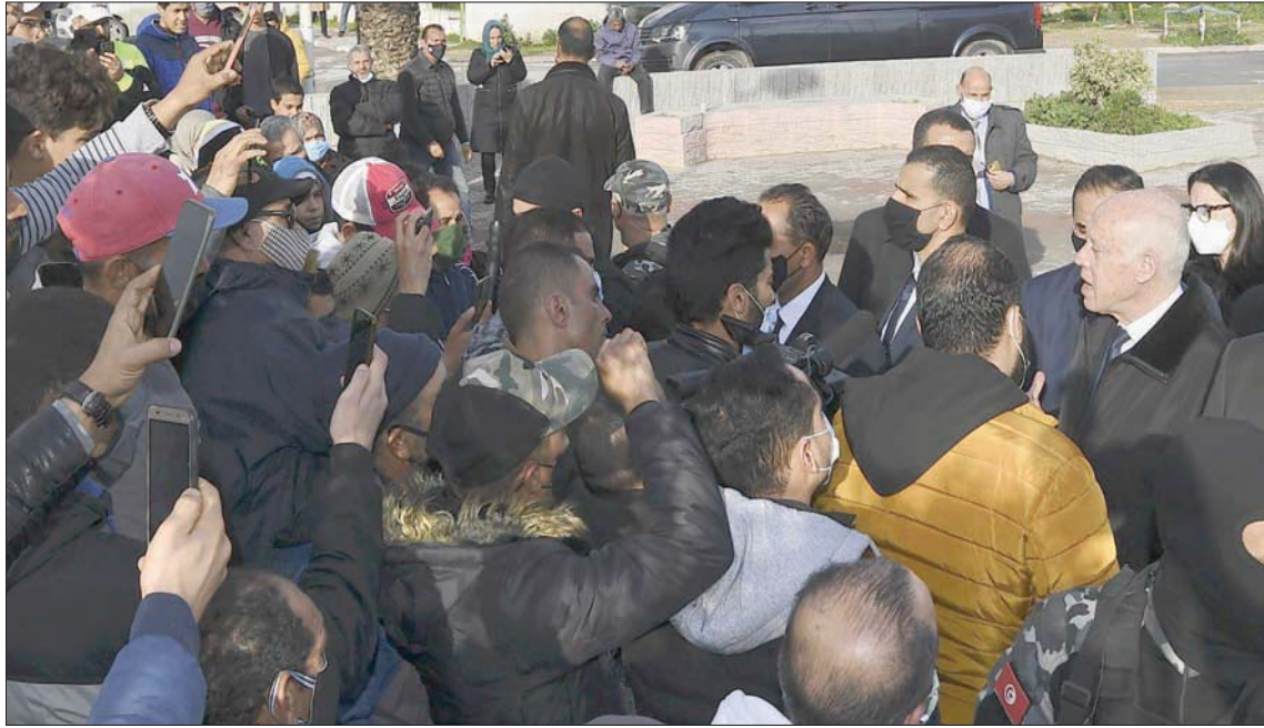
الرئيس قيس سعيد (إلى اليمين) خلال محاولته تهدئة المحتجين في حي الرفاه بالعاصمة مساء أول من أمس

تونس، المنجي السعيداني لندن، الشرق الأوسط رغم حظر التجول المفروض للحد من انتشار فيروس كورونا المستجد، ورغم تدخل رئيس الجمهورية قيس سعيد لتهدئة الأوضاع بعد ليلة رابعة من الاضطرابات والاعتقالات، ما يزال التوتر يسود جل مدن تونس، فيما انتشرت على مواقع التواصل الاجتماعي دعوات للتظاهر أسس ضد الفقر وغلاء المعيشة.