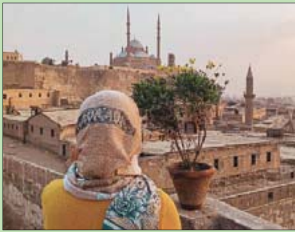
إطلالة المرسم المميزة اجتذبت الشباب