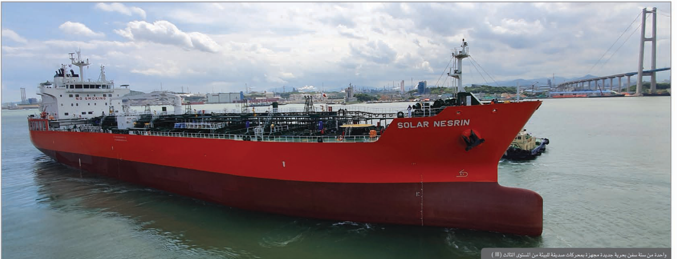
واحدة من ستة سفن بحرية جديدة مجهزة بمحركات صديقة للبيئة من المستوى الثالث (III)