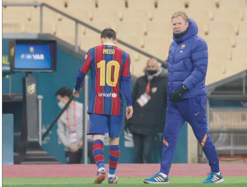
كومان مدرب برشلونة يراقب ميسي الغائب عن لقاء الغد بعد طرده في مباراة بلباو بنهاية السوبر

ويدين «المدفعجية» بفوزه الثامن إلى سرعتة في الهجمات المرتدة، وتلقى الغابوني بيار إيميريك أوباماينغ الذي سجل ثنائية (55 و77) ورفع بها رصيده إلى 5 أهداف فقط هذا الموسم، فيما كان الشاب بوكايو ساكا صاحب الهدف الآخر في الدقيقة 60. ورفع أرسنال الدفاع قبل استضافة غريمه مانشستر يونايتد بدورته الأخيرة، واصل نيوكاسل صحوته بتحقيقه فوزه الخامس في آخر ست مباريات، وجاء على حساب ضيفه نيوكاسل يونايتد 3 - صفر في ختام المرحلة التاسعة عشرة من الدوري الإنجليزي لكرة القدم. ومنذ خسارته القاسية على