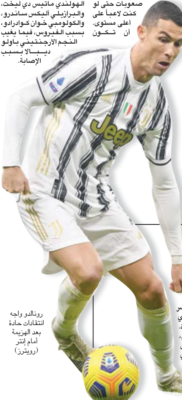
رونالدو واجه انتقادات حادة بعد الهزيمة أمام إنتر