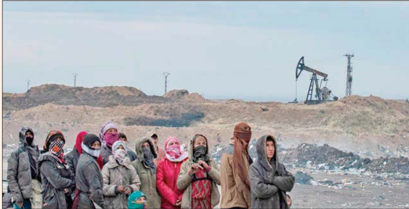
سوريون قرب حقل نفطي في ريف المالكية بشمال شرقي سوريا يوم الأحد

تفجير وقع في مدينة رأس العين الواقعة ضمن ما يعرف بمنطقة عملية «نزع السلاح» التي تسيطر عليها القوات التركية وفصائل ما يسمى «الجيش الوطني السوري» الموالي لانقرة بشمال شرقي سوريا. وقالت الوزارة، في بيان أمس (الثلاثاء)، إن وحدات الكردية، أكبر مكونات تحالف قوات سوريا الديمقراطية (قسد) أثناء وجودها في سجن تابع لها بمدينة القامشلي شمال سوريا، وأنهم أجبروها على تنفيذ العملية تحت تهديد إيقانها في السجن لسنوات طويلة حال رفضها.