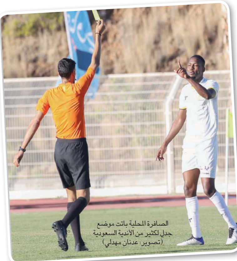
الصفارة المحلية باتت موضع جدل لكثير من الأندية السعودية

للرجوع للتقنية من بينها احتساب الأهداف، والطرد المباشر وركلات الجزاء وتصحيح أخطاء توجيه البطاقات والقرارات المتعلقة بذلك ولذا يجب أن تسود الثقافة في هذا الجانب، حيث إن الهدف هو تصحيح الأخطاء الفادحة وليس التقديرية، حيث إن مراجعة كل حال يعني أن كرة القدم تحولت إلى «بلاي ستيشن».