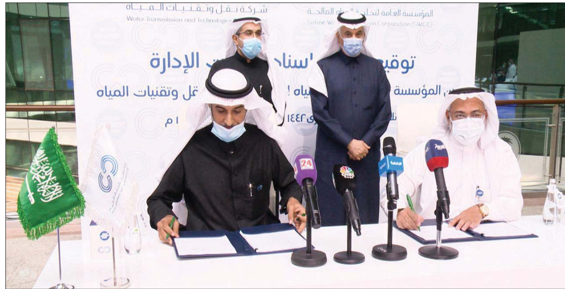
إبرام اتفاقية لفصل منظومة النقل عن الإنتاج في تحلية المياه بالسعودية أمس (الشرق الأوسط)

ومن المقرر أن تبدأ الشركة خلال العام الحالي 2021 في استكمال أعمالها التجارية بتفعيل الأنظمة والعمليات، وحوكمة الإجراءات، وتوقيع الاتفاقيات التجارية مع الشركاء في القطاع، إضافة إلى تسلم الأصول التشغيلية، وبدء تطوير المشروعات الجديدة في المنظومة، وتنضم خطنها للعام المقبل وتحسين وتطوير الكفاءة