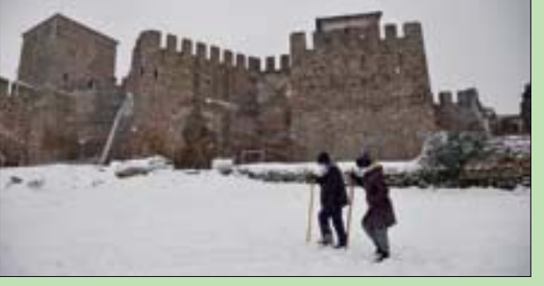
المشي على الثلج في ثيسالونيكي بشمال اليونان أمس

لندن، «الشرق الأوسط» أولياً للاختبار، بل تصدر عينات هندسية من خط إنتاج ضخم. وهذا يدل على أن المنتج سيكون جاهزاً تجارياً في وقت قريب، فقد أنتجت الشركة 1000 عينة من البطاريات من خلال شراكتها مع الشركة المصنعة في الصين «إف إنجيري» حيث تم تصنيع هذه العينات، المتوافقة مع شهادات بطاريات «لي» إن من الممكن وضعه في حاوية عادية على متن شاحنة ونقله إلى الاستادات ومدن الملاهي وغيرها من أماكن التجمعات، حسب رويترز. وقال نوريهيسا للصحافيين خلال العرض «بالنظر إلى الاتجاه العالمي، نحتاج إلى زيادة عدد من يخضعون للفحص والطلب على الفحص الوقائي في ازدياد». وتواجه حكومة رئيس الوزراء الياباني يوشيهيدي سوجا انتقادات بسبب قلة الفحوص التي تجريها البلاد. وتعرض حكومته لضغوط