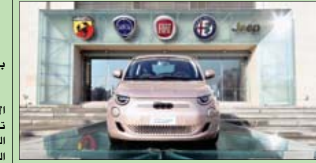
سيارة قبات الكهربائية في ميلانو

برلين - لندن، «الشرق الأوسط» كشفت دراسة أجرتها جامعة «بايلور» الأميركية أن التنوع في استهلاك الأطعمة التي تم الحصول عليها من السوق خارج النظام الغذائي التقليدي -ولكن ليست ضمن إجمالي السعرات الحرارية التي تحرق يومياً- يرتبط بشكل موثوق بدهون أجسام أطفال السكان الأصليين بالأمازون. وتقدم الدراسة نظرة عامة على البدانة العالمية. وقال صامويل أورلتشر، الأستاذ المساعد لعلم الإنسان «الأنثروبولوجي» في جامعة «بايلور» والمؤلف الرئيسي للدراسة: «باستخدام إجراءات المعيار الذهبي لإنفاق الطاقة، نُظهِر أن الأطفال النحفاء نسبياً في الأمازون ينفقون تقريباً نفس العدد الإجمالي للسعرات الحرارية يومياً مثل نظرائهم الأكثر