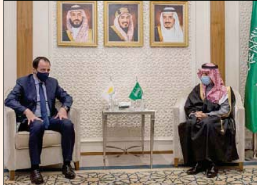
وزير الخارجية السعودي خلال استقباله نظيره القبرصي

وزير الدولة للشؤون الخارجية السعودي استقبل بدوره وزير خارجية قبرص، وبحث الجانبان العلاقات بين البلدين وسبل تطويرها في مختلف المجالات، إضافة إلى بحث الأوضاع الإقليمية والدولية ذات الاهتمام المشترك.