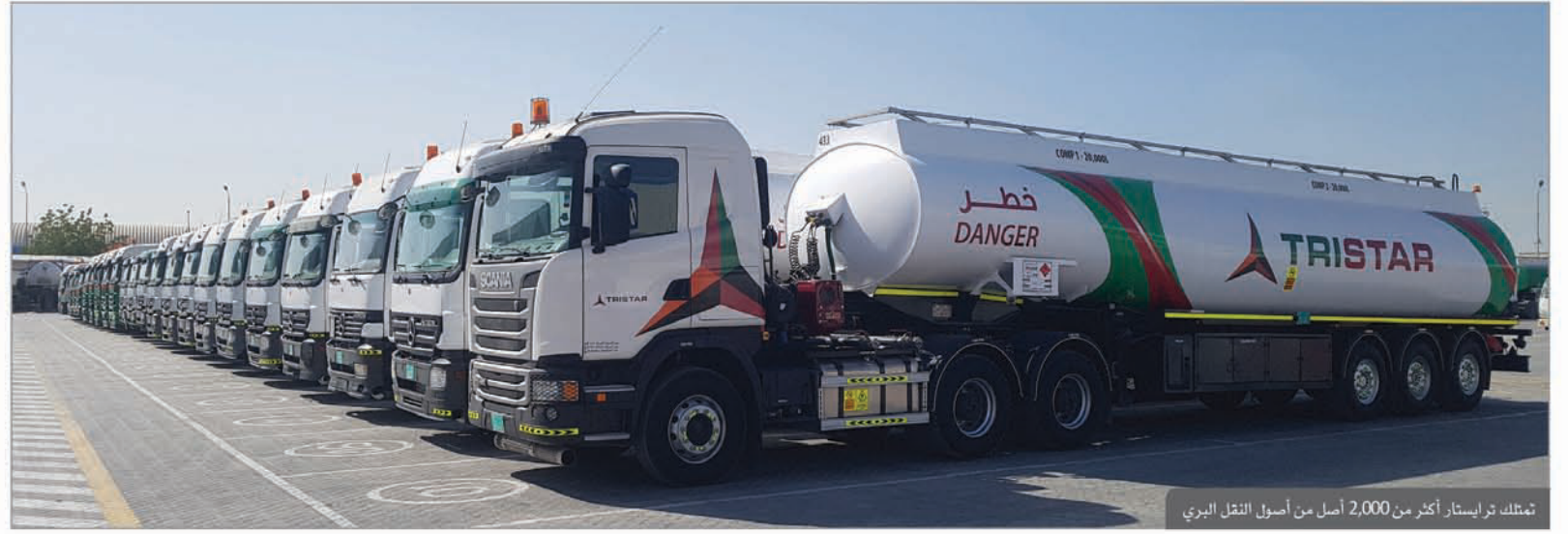
تمتلك ترايستار أكثر من 2,000 أصل من أصول النقل البري

هل يمكنك شرح جميع الحلول التي تقدمونها لمن ليس لديهم معرفة سابقة عن مجموعة ترايستار؟ بالتأكيد، تنقسم أعمالنا إلى أربعة قطاعات أعمال: • الوقود - يقدم قطاع الوقود بالمجموعة إمدادات وخدمات ووقود شاملة في المناطق النائية وللعلماء التجاريين. • النقل البري والتخزين - تشمل خدمات النقل البري للمجموعة خدمات ربط و توصيل الوقود والطيران، وخدمات معالجة و معاملة سلع المواد الخطرة وتخزينها وتوزيعها ونقل السوائل شديدة التبريد والغازات. • الخدمات اللوجستية البحرية - تشمل الخدمات الرئيسية التي تقدمها المجموعة امتلاك السفن واستئجارها، وخدمات الإمداد بالوقود الشاطئية، وخدمات الإمداد البحري، وخدمات الشحن الساحلية الداخلية وإدارة المشاريع. • مستودعات الوقود - تمتلك المجموعة مستودعات الوقود