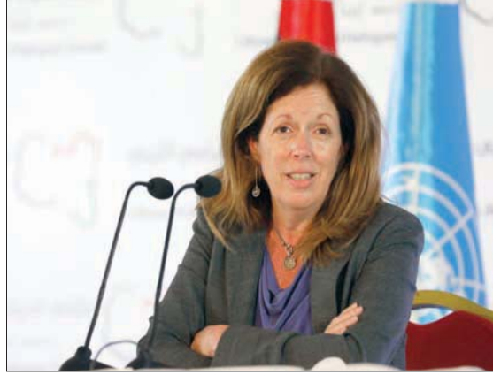
ستيفاني وليمان، رئيسة البعثة الأممية بالإتابة

نية واضحة لتنفيذ اتفاق اللجنة العسكرية المشتركة (5+5)، وفي مقدمة ذلك سحب المرتزقة، الذين ما زالوا موجودين في سرت والجفرة»، على حد تعبيره. لكنه أكد في المقابل أن هذه الدول مشاركة في رسم الخريطة الجديدة. ورأى البشتي أن بعض المسؤولين الليبيين يبحثون عن نفوذ خارجي كي تكون لهم اليد الطولى في البلاد، بما يمكنهم من تحديد السياسات العامة للبلاد، وتحطيق إلى أن هذه التحركات «التي تستهدف تحقيق مصلحة شخصية تعكس مرض هواء بالسلطة والشهرة، رغم تواضع خبرتهم السياسية... فهم يهبطون لأنفسهم بأن لقاءاتهم بمسؤولي هذه الدول العظمى تستغل منهم شخصيات ذات شأن في البلاد». وفي حين تضامن مع البشتي كثير من السياسيين، قال نائب برلماني إن هناك فرقاً كبيراً بين تحركات بعض الشخصيات التي «تبحث لنفسها عن دور ومنصب، حتى لو كان على حساب الشعب الليبي»، وبين الشخصيات المسؤولة المعروفة بالعمل الدؤوب لصالح الشعب، التي تسعى لدى دول العالم للمساعدة لحل الأزمة الليبية، مستدركا: «إبليتنا هذه الأيام بشخصيات ظلت طوال السنوات العشر الماضية تجمع الجوية بين المطارات الليبية والإيطالية.