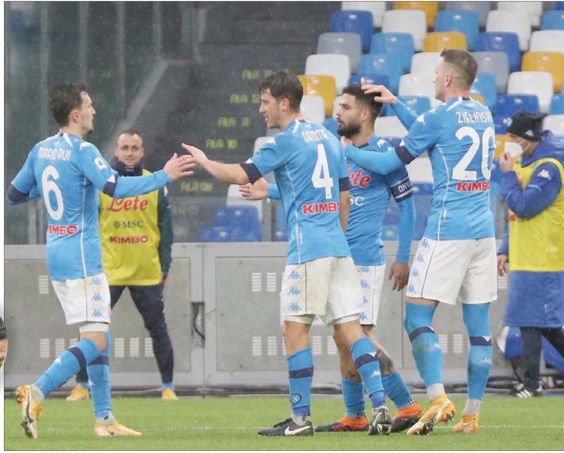
نابولي يستهل لقاء اليوم بمعنويات مرتفعة بعد اكتساحه فيورنتينا بسداسية في بطولة الدوري

وقال روبرتو مانشيني، مدير إيطاليا، عن بيرلو في برنامج «لامونيتا سبورتيفا» التلفزيوني: «في البداية، من الطبيعي أن تواجه صعوبات حتى لو كنت لاعباً على أعلى مستوى. أن تكون يعني الكثير لنا». ولن يكون نابولي الطرف الوحيد الذي يعاني من نقص في صفوفه اليوم بسبب «كوفيد 19»؛ إذ يفقد يوفنتوس مدافعه الهولندي ماتيس دي ليخت، والبرازيلي اليكس ساندر، والكولومبي خوان كوادرادو، بسبب الفيروس، فيما يغيب النجم الأرجنتيني باولو ديبالا بسبب الإصابة.