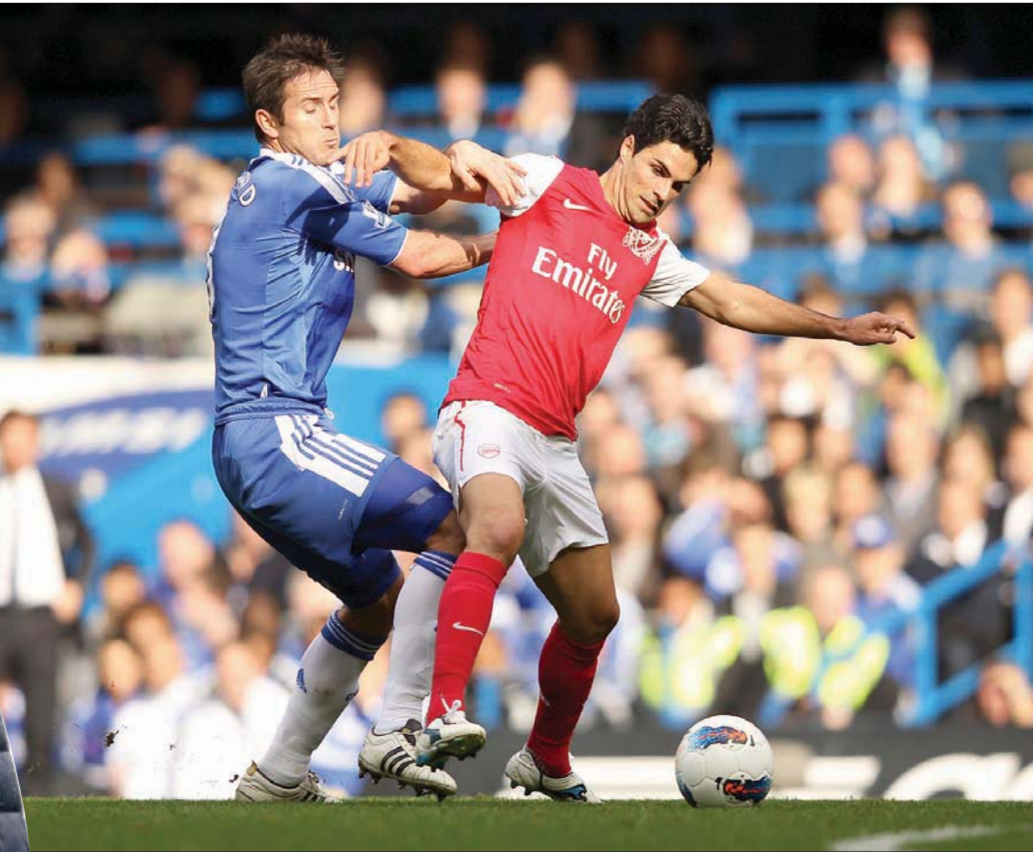
أرتيتا ولا مبارد بقميصي أرسنال وتشيلسي عندما كانا لاعبان قبل تولي قيادة الفريقين

ويعتقد أن يذهب للمدير الفني المبتدئ أيضاً أن يذهب للعمل في دولة مختلفة، وهو الأمر الذي قام به نجم ليفربول السابق ستيفن جيرارد عندما تولى تدريب نادي رينجرز الاسكتلندي، لكن هذا الأمر لم ينجح، مثلاً، مع غاري نيفيل عندما تولى قيادة فالنسيا الإسباني. لكن حتى هذا الأمر ينطوي على كثير من التعقيدات