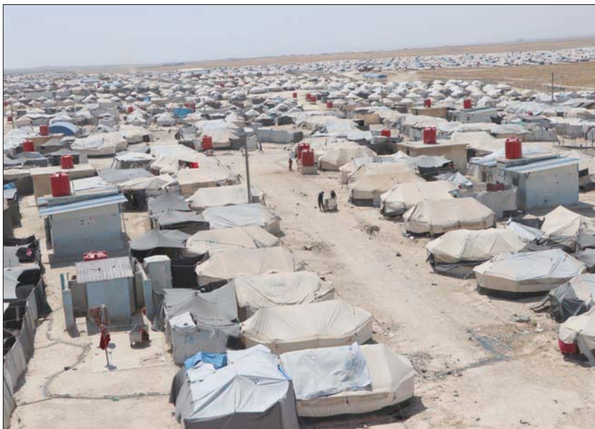
يشهد مخيم الهول في شرق سوريا تصاعداً لافتاً في جرائم القتل والفلتان الأمني

ولقت الأجهزة الأمنية القبض على ثلاثة أشخاص في إطار تحقيقاتها في مقتل 13 نازحاً سورياً ولاحقاً عراقياً في المخيم في الفترة القليلة الماضية. وكان آخر الجرائم مقتل لاجئ عراقي عُثر على جثته مفصولة الرأس عن الجسد وكل منهما يمكن بعيد عن الآخر. ولم تتمكن سلطات المخيم بعد من تحديد دوافع الجريمة والجاني أو الجناة وراء تنفيذ عملية القتل. ويؤي مخيم الهول القريب من الحدود العراقية 62 ألفاً يشكل السوريون والعراقيون النسبة الكبرى منهم. كما يضم قسماً خاصاً بالنساء الأجانب المهاجرات وأطفالهن ويبلغ عددهم نحو 11 ألفاً (3177 امرأة والبقية من الأطفال). وتتحدث النساء في هذا القسم من قرابة 50 دولة غربية وعربية. ويخضع قسم المهاجرات لحراسة أمنية مشددة. كما يمنع الخروج منه والدخول إليه إلا بإذن خطي من