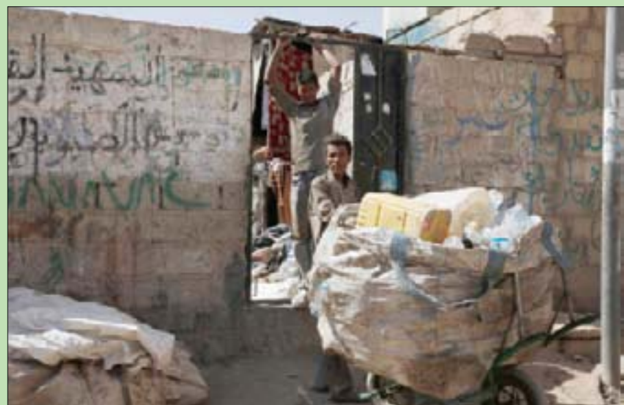
عامل قمامة في صنعاء، أمس

وصلت إلى حد الماسي الإنسانية سواء في الجانب الصحي أو الخدمي أو الاقتصادي في ظل الأوضاع المتدهورة، وتقول الأمم المتحدة بتشكل مستمر للتخديرات من أن اليمن يقترب من أزمة إنسانية غير مسبوقة.