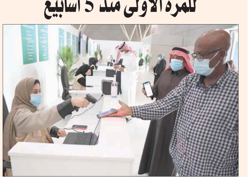
استمرار تطعيم سكان السعودية في عدد من المدن