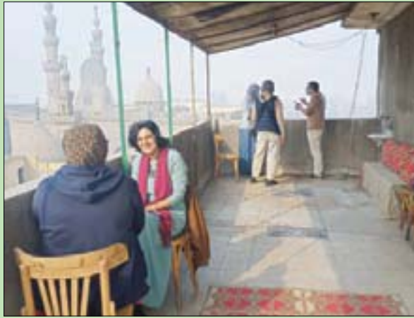
يُعد المرسم مساحة للتواصل الثقافي والتقاش بين الشباب (الشرق الأوسط)