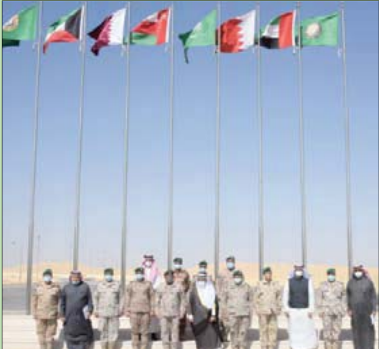
الحجرف لدى زيارته مقر القيادة العسكرية الموحدة في الرياض

وكان المجلس الأعلى لقيادة الخليج وفاق في بيان قمة العلا الأخيرة على تعديل المادة السادسة في اتفاقية الدفاع المشترك، على تغيير اسم قيادة «قوات درع الجزيرة المشتركة» إلى «القيادة العسكرية الموحدة لدول مجلس التعاون».