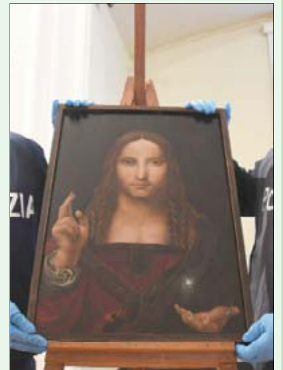
لوحة سلفاتور موندي المسروقة بعد استعادتها في نابولي

استعادت الشرطة الإيطالية نسخة تعود إلى القرن السادس عشر من لوحة «سالفاتور موندي» المنسوبة لوروشة ليوناردو دافنشي، بعدما سرقت من متحف في نابولي حسب ما نقل موقع «سي إن إن» أمس. وجرى اكتشاف العمل الفني، الذي من المرجح أن الذي رسمه طالب في عصر النهضة، داخل إحدى الشقق أثناء عملية بحث وتفتيش داخل المدينة الإيطالية، تبعاً لما ورد في بيان صادر عن الشرطة. وعثر على مالك اللوحة البالغ من العمر 36 عاماً بالجوار واقادته الشرطة إلى الحجز للاشتباه في تورطه في تلقي سلع مسروقة. وجرى تصميم الصورة على غرار أسلوب تصوير دافنشي الشهير للسيد المسيح وهو يرفع يداً واحدة طلباً للبركة، بينما تحمل الأخرى كرة بلورية. وقد جرى عمل نسخ عديدة من العمل خلال حياة الفنان على أيدي طلابه ومساعديه.