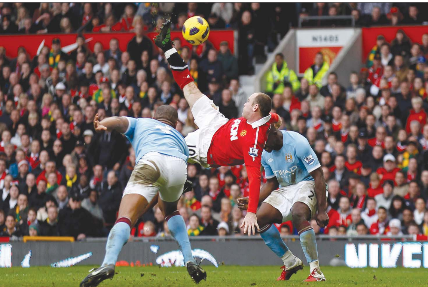
روني وهدفه الشهير في شبك مانشستر سيتي

ومن غير المتوقع أن يحقق روني نجاحاً في مجال التدريب يعادل النجاح الكبير الذي حققه كلاعب. هذا لا يعني أنني أشك في قدراته كمدير فني، لكنه مجرد وجهة نظر وتوقع شخصي. فرغم أن لاعبين عظماء مثل كروفيت وبيكينباور قد حققوا نجاحات هائلة في مجال التدريب، فهناك العشرات من اللاعبين العظماء