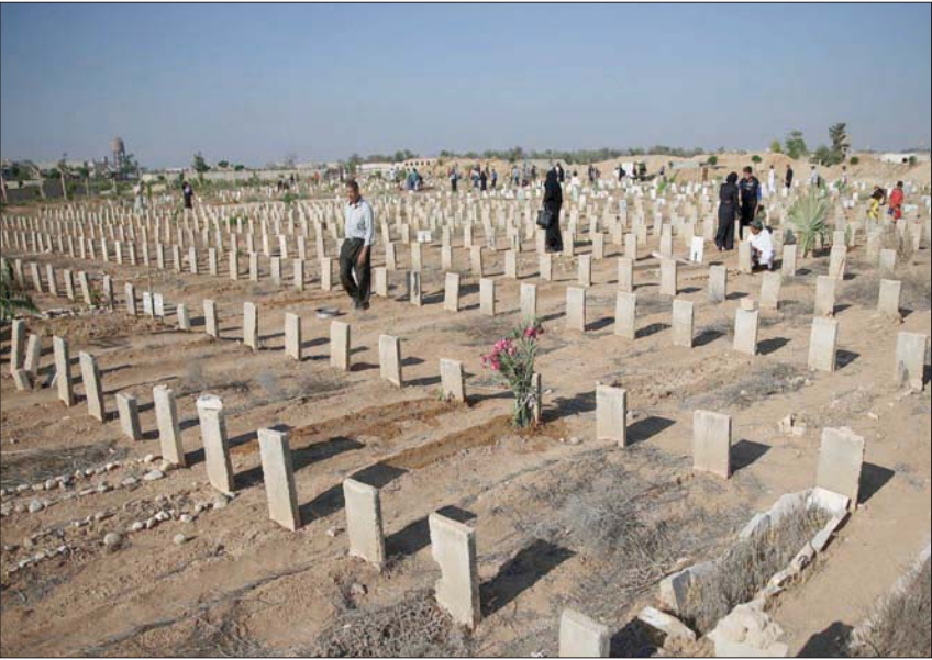
مقبرة «نجها» تزدهم بوفيات «كورونا» (رويتزن)

أظهرت شواهد القبور في القسم المخصص لدفن الضحايا من المسلمين دفن ضحايا من أتباع المذهب الشيعي فيه.