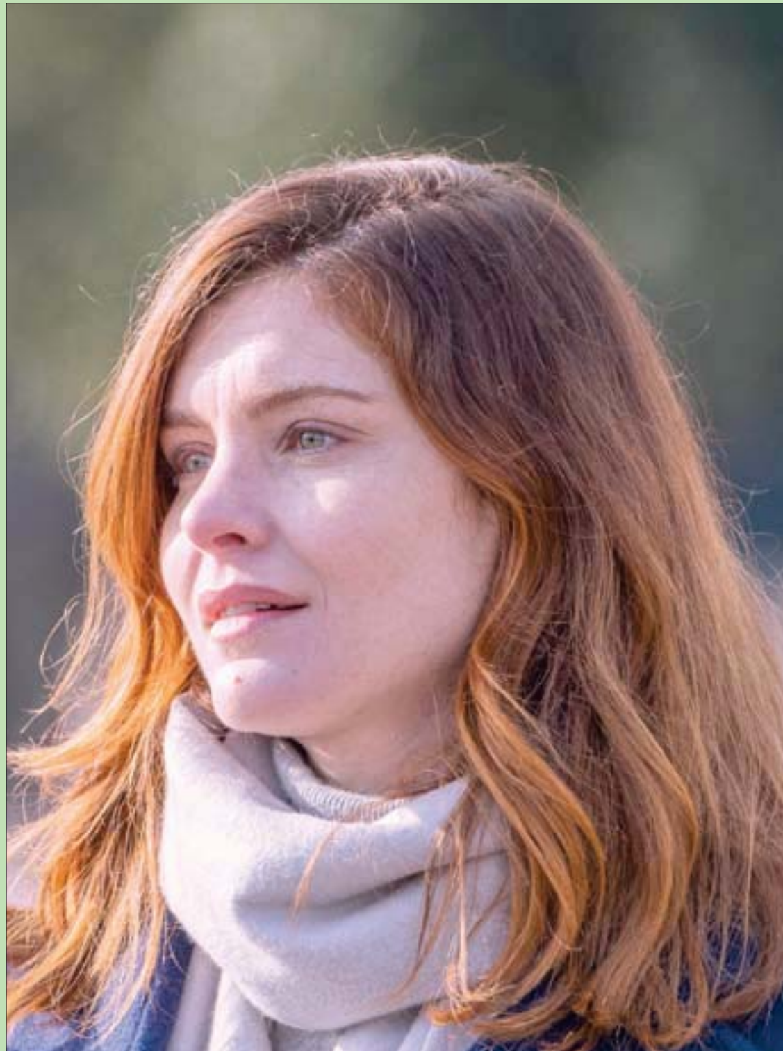
المثلة الإيطالية فيتوريا بوتشيني أثناء تصوير فيلم «لا تتركني» في البندقية

هذا الصدام المبكر -لم يمض شهر على تشكيل الحكومة- إشارة غير طيبة، وأحد نواب التصعيد قال بالنص: «هذا هو الدرس الأول فقط». من الطرف الذي يريد «ترويض» الحكومة الحالية، وكل الحكومات المقبلة؛ وما موقف ودور وهدف «الإخوان» قلب المعارضة، في هذا كله؟ والأهم من ذلك، ما أولويات المواطن الكويتي الحقيقية؟