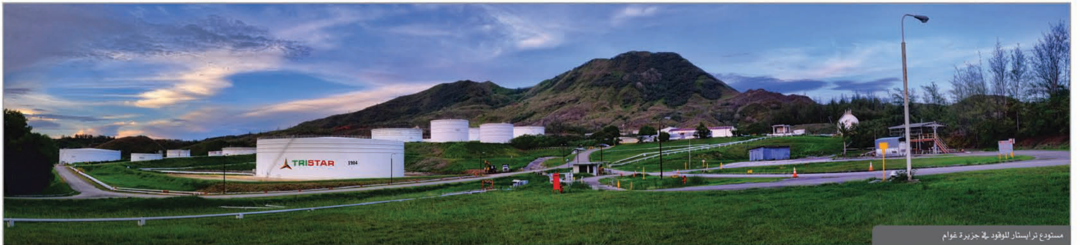
مستودع ترايستار للوقود في جزيرة غوام