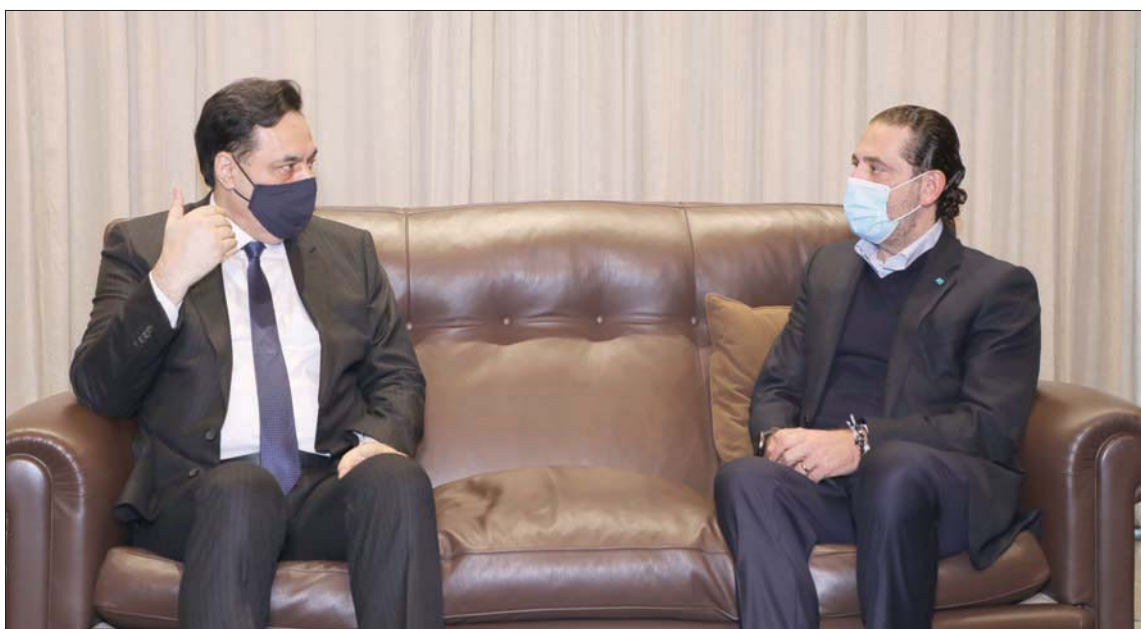
من لقاء الرئيسين دياب والحريري (الآتي ونهرا)

وبالنسبة إلى تحرك دياب باتجاه الرؤساء الثلاثة، قالت المصادر بأنه أراد من تحركه أن يمرر أولاً رسالة تضامن مع الحريري ولو جاءت متأخرة على خلفية اتهامه لونه بالكذب في حضور دياب في ضوء التساؤلات التي طرحت حول عدم رده على هذا الاتهام، وثانياً، إعلام تصريف الأعمال غير قادرة على تبرير الأمر بأن حكومة تصريف الأعمال غير قادرة على الاستمرار في ظل تراكم الأزمات الاجتماعية والاقتصادية وارتفاع منسوب الإصابات بوباء فيروس كورونا بعد أن تجاوزت الخطوط الحمراء، وهذا ما يستدعي الإسراع بتشكيل الحكومة اليوم قبل الغد.