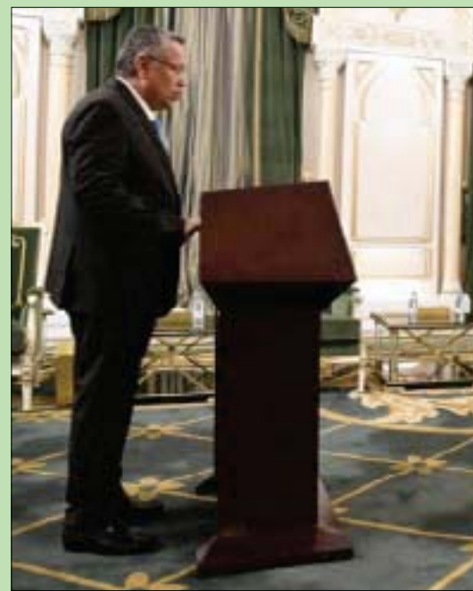
بن دغر يؤدي اليمين أمام هادي في الرياض أمس

وكان هادي أصدر يوم الجمعة الماضي قرارات بتعيين مستشاره أحمد عبيد بن دغر رئيساً لمجلس الشورى، وتعيين نائبين له، كما أصدر قراراً بتعيين سبقت تنفيذ «اتفاق الرياض» الرسمية أن الرئيس اليمني أكد بعد أداء المعينين لليمنين القانونية على «الأهمية الدور التشريعي والنهج الديمقراطي في إطار السلطة التشريعية نحو المستقبل المنشود خصوصاً في هذه المرحلة الاستثنائية الراهنة».