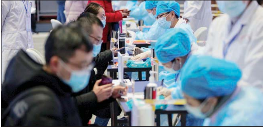
صينيون يسجلون لتلقي اللقاح في شنغهاي أمس

ونقلت وكالة الأنباء الصينية الجديدة (شينخوا) عن اللجنة، القول في تقريرها اليومي، إن 106 من الإصابات الجديدة محلية العدوى، بينما البقية قادمة من الخارج.