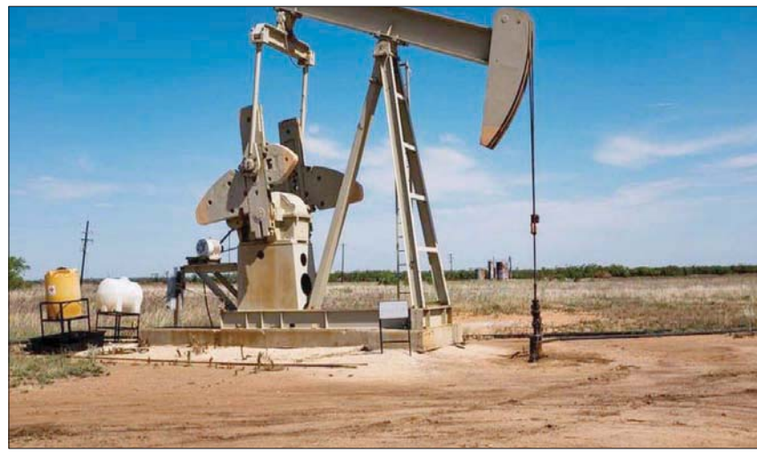
جانحة «كورونا» تزيد الضبابية في أسواق النفط

وفي هذا الصدد، أظهرت بيانات من مصادر تجارية أن واردات الهند من النفط الخام قفزت في ديسمبر (كانون الأول) إلى أعلى مستوياتها فيما يقرب من 3 سنوات إلى أكثر من 5 ملايين برميل يومياً، مع زيادة شركات التكرير الإنتاج لتلبية تعافي الطلب على الوقود. وتزامن اندفاع الهند في نهاية العام للحصول على إمدادات النفط الخام مع زيادة الطلب من المشترين في شمال آسيا خلال فصل الشتاء، مما أدى إلى ارتفاع الأسعار، وتسريع عمليات السحب من المخزون العالمي العام. وكشفت البيانات أن واردات الهند، ثالث أكبر مستورد ومستهلك للخام في العالم، من النفط في ديسمبر (كانون الأول) زادت بنحو 29 في المائة عن الشهر السابق، ونحو 11,6 في المائة عن الفترة نفسها قبل عام. بعد أن ارتفع استهلاك الوقود في ديسمبر (كانون الأول) للشهر الرابع على التوالي إلى أعلى مستوى له في 11 شهراً.