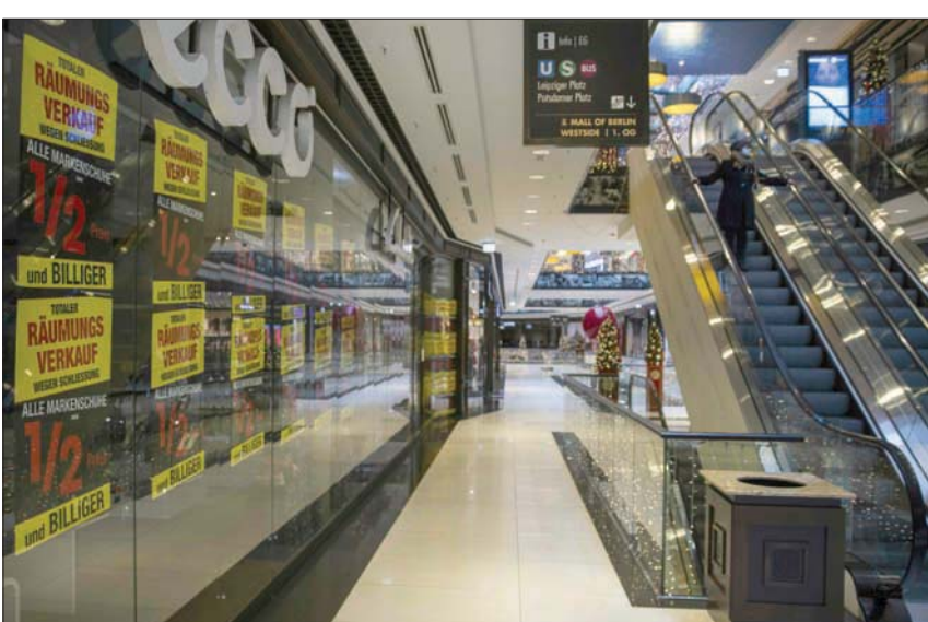
أحد متاجر الأحذية يعلن الإغلاق في «مول برلين» أكبر مركز تسوق في العاصمة الألمانية

لفترة إغلاق جزئي في ألمانيا في حين استمرت المناجر في العمل. واضطرت جميع المتاجر إلى إغلاق أبوابها من منتصف ديسمبر (كانون الأول) مع تشديد القيود لاحتمال تزايد معدلات الإصابة بفيروس كورونا. وكانت مبيعات التجزئة على الإنترنت، أكبر الراحيين في نوفمبر: إذ زادت الإيرادات 31,8 في المائة مقارنة بما قبل عام بينما زاد الإنفاق على الأجهزة المنزلية ومواد البناء وأدوات تزيين المنازل بنسبة 15,4 في المائة.