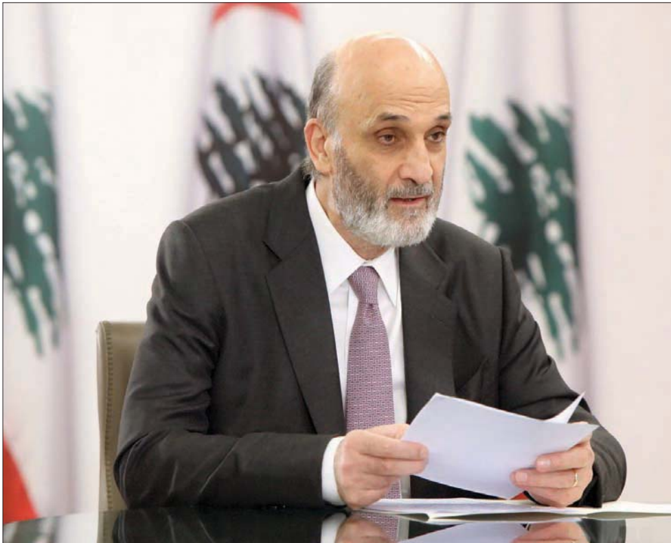
رئيس حزب «القوات اللبنانية» سمير ججمع

وتنص قانون المحاسبة العمومية على أن تقوم مديرية الموازنة ومراقبة النفقات في وزارة المالية بدرس موزانات الوزارات التي وردتها حتى مهلة 31 يوليو (تموز) من كل عام، لتعمل الوزارة خلال شهر أغسطس (آب) على توحيد الموزانات وتحضير مشروع الموازنة العامة، وإحالته إلى مجلس الوزراء، الذي يفترض أن يدرس المشروع ويصدق عليه ويحيله إلى مجلس النواب في مهلة قصوى في مطلع أكتوبر (تشرين الأول)، وتبدأ اللجان البرلمانية المختصة بدراسته وإحالته إلى اللجنة العامة لإقراره.