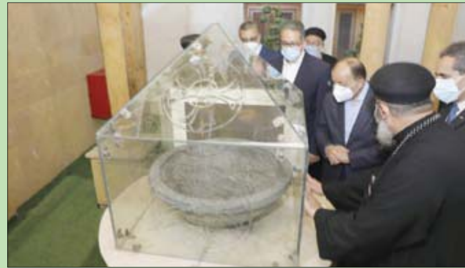
مسؤولون مصريون يتفقدون إحدى محطات مسار «العائلة المقدسة»

وأكد العناني اهتمام الدولة بإحياء مسار العائلة المقدسة، إذ توليه الوزارة اهتماماً أثرياً وسياحياً كبيراً، ففي الوقت الذي يُرمم المجلس الأعلى للآثار المواقع الأثرية الواقعة على هذا المسار، تطور هيئة التنمية السياحية الخدمات السياحية بها، ورفع كفاءة الطرق المؤدية إليها بالتعاون مع وزارة التنمية المحلية، وجهاز