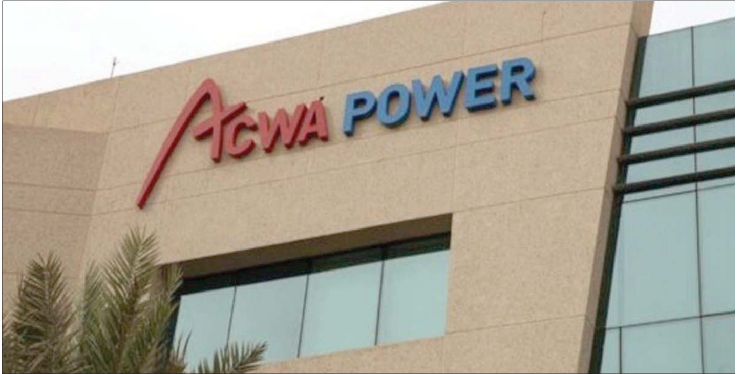
خصص التمويل لدعم استثمارات «أكوا باور» بمشاريع الطاقة المتجددة في الدول التي تعمل بها إضافة إلى تمويل استثماراتها بالأسواق عالية النمو المستهدفة مستقبلاً (الشرق الأوسط)

النمو لدى «أكوا باور». ونركز من جانبنا على تمكين الحلول التحولية للمساعدة في الحد من البصمة الكربونية، ورفع حصة الطاقة النظيفة المتجددة في السعودية وعالمياً. كما أسفر نجاح هذا الإغلاق المالي في الوقت المناسب عن تعزيز الشراكة بين «أكوا باور» و«إيبيكورب» بوصفها شريكاً مالياً طويلاً نحو