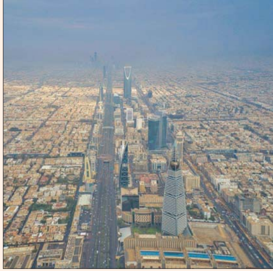
السعودية تعتمد برنامج الامتياز العقاري للمرة الأولى تدعياً لنقل التقنية والمعرفة في القطاع

علاقة استراتيجية في مجال الأنشطة العقارية، وتسهيلاً لتبادل المعلومات والخبرات على نحو يخدم مصلحة الطرفين، وتحقيق الأهداف التخليمية المتعلقة باختصاصات كل من الهيئتين.