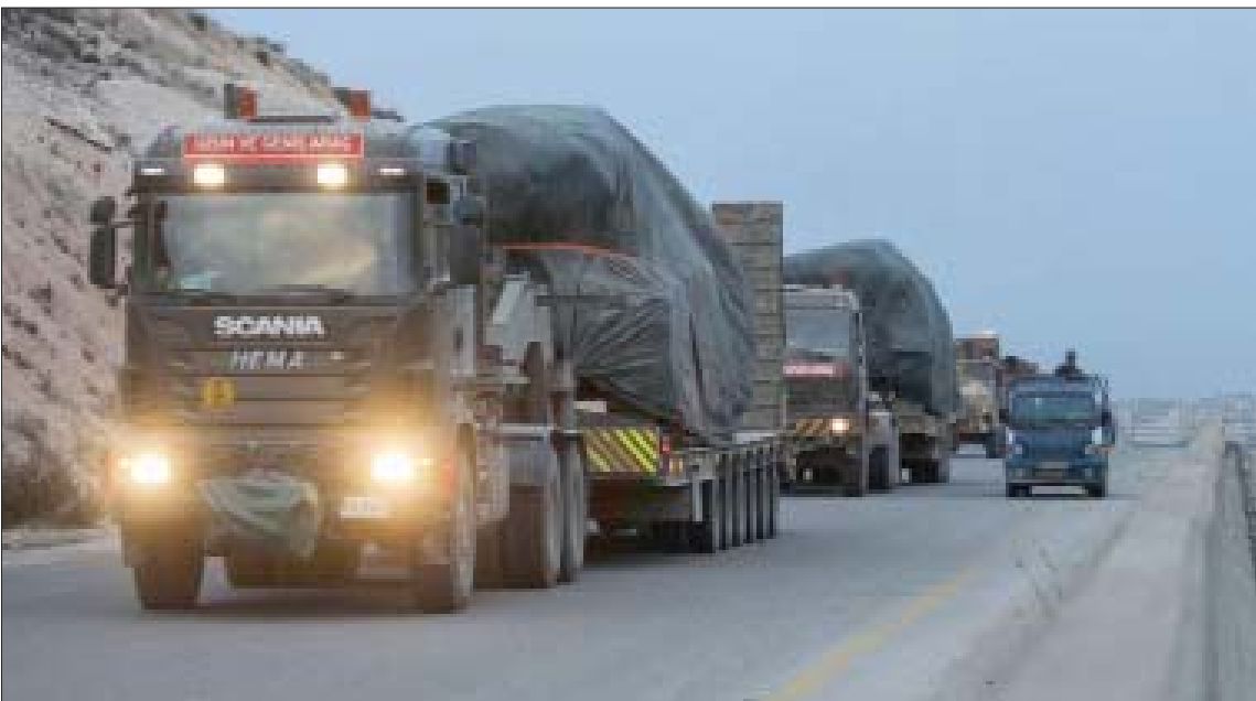
انقرة، سعيد عبد الرازق

تواصل القوات التركية تحركاتها المكثفة في منطقة «خض التصعيد» في شمال غربي سوريا، الممتدة من جبال اللاذقية الشمالية الشرقية وصولاً إلى الضواحي الشمالية الغربية لمدينة حلب مروراً بريف حماة وإدلب، ما بين تنفيذ انسحابات من النقاط العسكرية التي أنشئت بموجب اتفاق خفض التصعيد في أسنانه والاتفاقات اللاحقة بين تركيا وروسيا وإعادة التمركز في مناطق أخرى لا سيما في جبل الزاوية جنوب إدلب. وفي أحدث هذه التحركات، نشرت القوات التركية كباتن حراسة واكشاك مراقبة سابقة التجهيز مزودة بزجاج مضاد للرصاص في مواقع عدة على طريق حلب