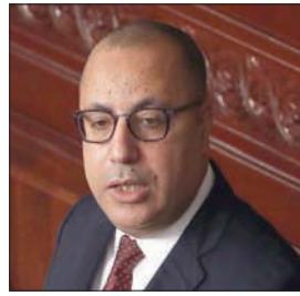
هشام المشيشي (ب.أ)

مبكرة. البرلمان قام بواجبه والنقاش داخله ظاهرة صحية. لكن من لا يقوم بواجبه هو رئيس الجمهورية... الرئيس يصد الترشح وإطلاق خطبات غير مسؤولة... على صعيد غير متصل، شرع البرلمان التونسي أمس، في النظر بمشروع قانون متعلق بتتبع