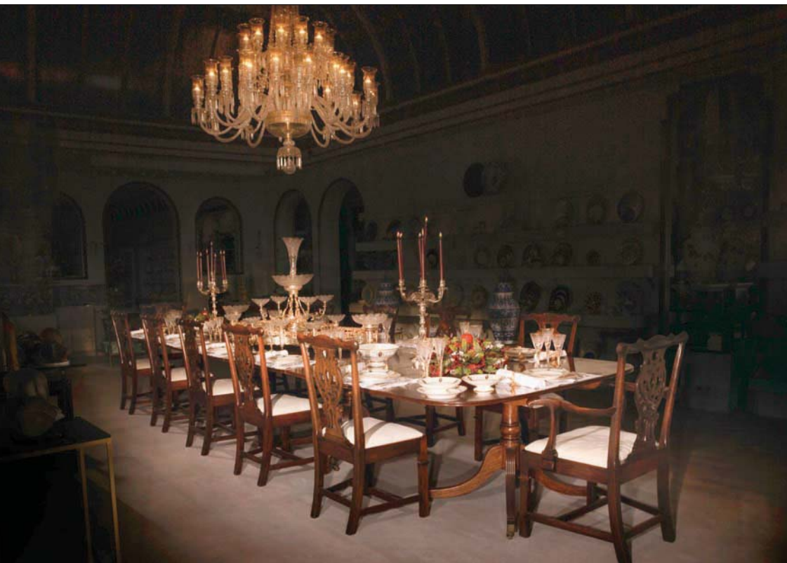
مائدة الإمبراطور نابليون

تخيل أنك ضيف في مادية ملكية أو مدعو للعشاء في قصر أمير موناكو أو مهرجان هندي، الخيال يسبح بك ما بين المائدة العاصرة بالأطباق الشهية وما بين الأواني والأطباق والكؤوس المزخرفة بالفضة والذهب إلى الكريستال المتألق. مثل هذه المآدب نراها في الأفلام وفي المسلسلات مثل «ذا كراون» الذي صور الحياة في قصور بريطانيا ومسلسل «داونتن أبي» الذي صور حياة النبلاء والعائلات الأرستقراطية. من الخيال للواقع يمكنك الآن رؤية أطعم من الخرف الفاخر الملون والمذهب بجميع التصميمات الراقية، وهي نسخ طبق الأصل من أطعم حلت على موائد ملوك الشرق والغرب، وزينت غرف طعام النبلاء والمشاهير، وهو ما يقدمه مزاد «سوتبيز» الحقام أو ثلاثين حالياً.