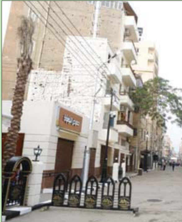
تطوير المناطق المحيطة بالمواقع الأثرية من بين متركزات المشروع