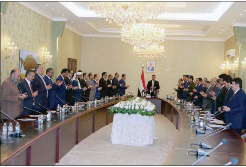
أعضاء الحكومة اليمنية يقرأون الفتحة قبيل بدء أول اجتماع لهم في عدن

وأفاد مكتب غريفيث، في بيان على موقعه الرسمي، بأن زيارة المبعوث الخاص ستكون أولاً إلى الرياض للقاء الرئيس اليمني عبد ربه منصور هادي، وكبار المسؤولين السعوديين، ليتنقل بعدها إلى عدن للقاء رئيس الوزراء معين عبد الملك وأعضاء الحكومة اليمنية.