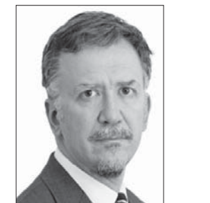
جون أوشرز *

علينا أو لا تطعيم الفئة الأكثر عرضة لمخاطر الفيروس. وهذا يعني منح الأولوية لكبار السن ومن يعيشون في دور الرعاية، ثم توزيع اللقاحات بعد ذلك بصورة مطردة على الفئات العمرية الأصغر فالأصغر. وهذا ما يحدث في المملكة المتحدة وألمانيا في الأونة الراهنة. ويعد المنهج الآخر أكثر نفعية. إذ ترى مدرسة الفكر هذه التي ترجع تاريخها إلى المفكرين الليبراليين من العصر الفيكتوري بقيادة جون ستينوارت ميل، أنه ينبغي علينا البحث عن أكبر نفع ممكن لأكثر عدد من الناس. وبالتالي، يمكن تبرير التضحية بقليل من الناس بغير إنقاذ الكثيرين. ومن شأن ذلك أن يؤدي إلى تطعيم الأشخاص الأكثر عرضة للإصابة بالفيروس وانتشاره، حتى إن كانت مخاطر الوفاة بينهم منخفضة. وسوف تذهب اللقاحات إلى الأطباء وعمل الطوارئ أولاً، ثم يتبعهم نزلاء السجون، ثم الناس الذين يتعاملون مع كثير من الأشخاص الآخرين، فإن هذا يشبهه يعيشون في المجتمعات الأكثر عرضة لانتشار الفيروس بصورة خاصة. وهذا هو المنهج المنبع إلى درجة