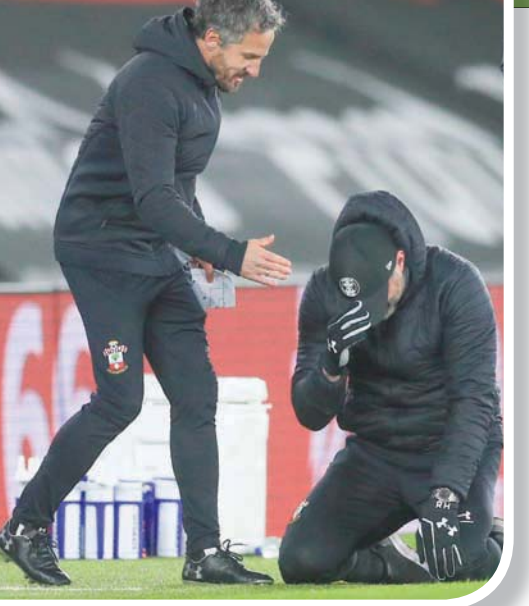
هازنهوتل مدرب ساوثهامبتون يجثو باكيا بعد الفوز

ماني داخل منطقة الجزاء. وعلق كلوب: «أفضل موقف لنا كان عند استحواذ ساديو على الكرة بين قدميه. أي شخص يقول إنه أسقط نفسه فهذه دعابة كبيرة... تركيزنا على ذلك». وانتقد جيمي كارغار مدافع ليفربول السابق أداء الفريق وقال إنه نسي كيف يلعب في الدقائق الأخيرة بعدما أخفق في تحقيق أي فوز في آخر ثلاث مباريات بالدوري. وأوضح: «استوى ليفربول خارج أرضه هذا الموسم سي جدا... هذا أكبر مصدر للقلق مقارنة بما يفعله في أرضه».