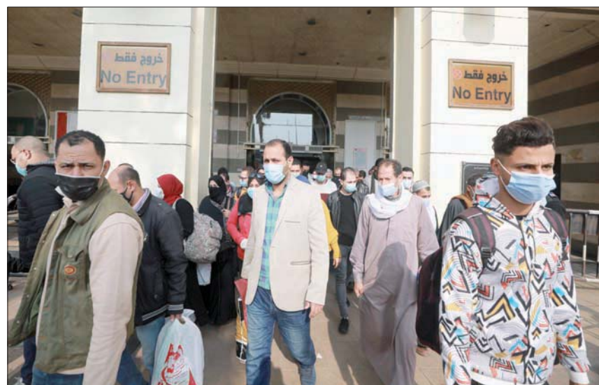
الحكومة المصرية تفرض غرامة على مخالفي ارتداء الكمامة

المصريون الذين أضوا قرابة عشرة أشهر في تفاعل اتسم بالضغط والإكراه - كما غيرهم من شعوب العالم - مع تلك الأقنعة، يستأنفون نشاطهم اليوم على واقع جديد نظرياً، إذ تفرض السلطات غرامة تبدأ من 15,8 جنيه (الدولار يساوي 15,8 جنيه) على غير المتزمين بها، ويعد أن كانت العقوبة سابقاً - تشمل - مثلاً - قائد سيارة النقل الجماعي وحده، بات الرهاب تحت طائلة العقوبة نفسها. ولم تفلح إن محاولات أبناء النيل في «تصميم الكمامة»، رغم سعي بعضهم في أن يضيفوا عليها صفات التشاركية والجماعية، على ما حاولت قلة ابتدعت «الكمامة الدوارة» في «مطلع عصر الصدمة» برصد