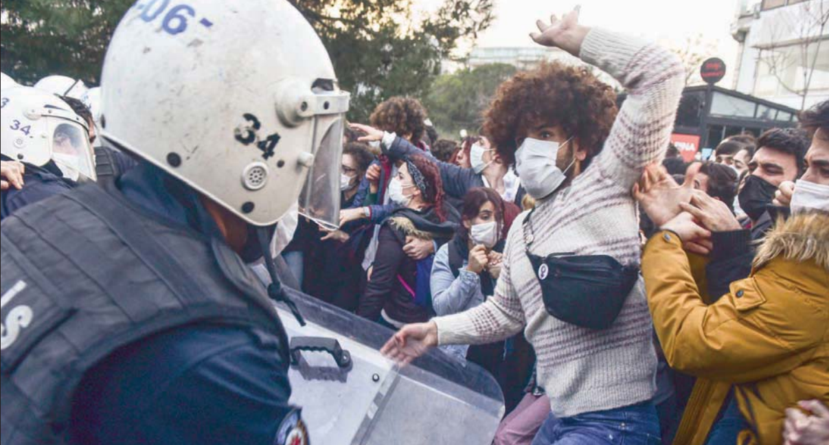
مواجهات بين طلاب جامعة «اليسفور» والشرطة في أنقرة أول من أمس