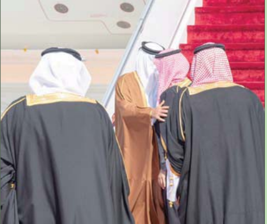
عناق بين ولي العهد السعودي وأمير قطر في العلا أمس