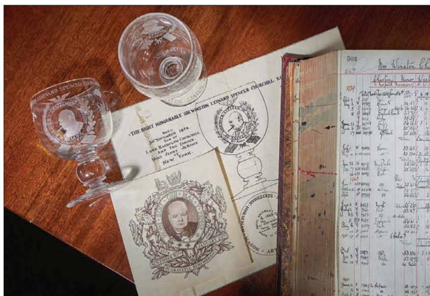
كأس تذكارية صنعت لوينستون تشرشل

ويقدم منها في المزاد كأس صممت لتتويج الملك إدوارد الثامن، الذي لم يحدث بسبب تخليه عن العرش ليتزوج المطلقة الأميركية واليس سيمبسون. وهناك أيضاً المزهية الحمراء