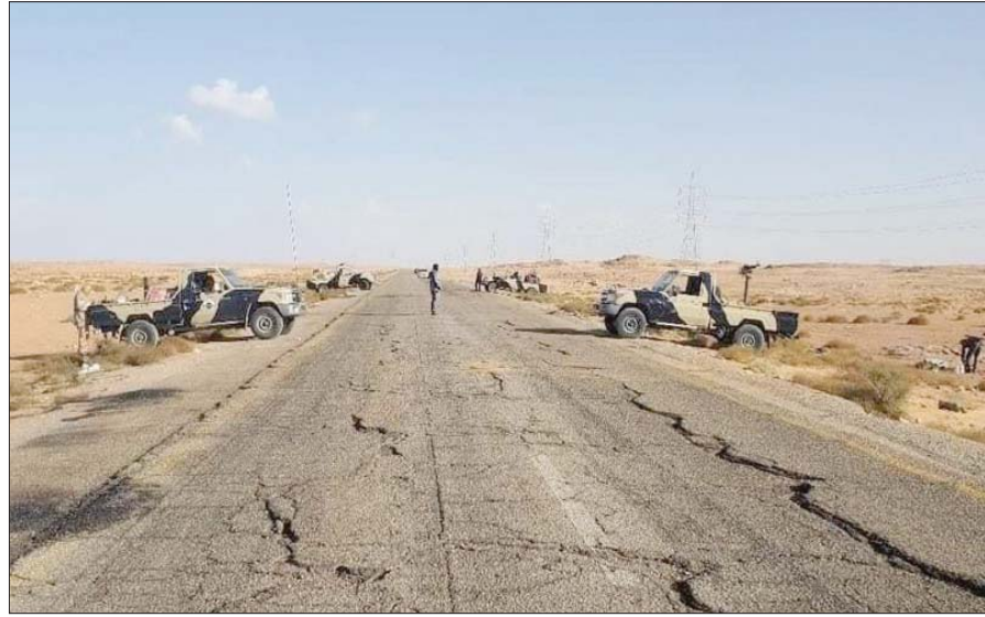
دوريات تابعة لـ «الجيش الوطني» لتأمين بعض مدن الجنوب الليبي

جديد للهدنة، وقال في أمس إن قوات «الوفاق» تراقب عن كثب تحركات لقوات الجيش في منطقة الجبالية، وغرب مدينة سرت. من جهته، أعلن فتحى باشاغا، وزير الداخلية بحكومة «الوفاق» عقب اجتماع عقده أمس مع وفد «الوفاق» المشارك في اجتماعات اللجنة العسكرية المشتركة، التيشيش شش «الجيش الوطني»، عن تشكيل قوة أمنية مشتركة لتأمين الطريق الساحلي، وتجهيزها بكافة الإمكانات المطلوبة. كما أعلن المشري الاتفاق على التشاور الدائم لهذه اللجنة مع لجنة الحوار بالجلس للوصول الوطنية، وتسهم في الاستقرار الأمني