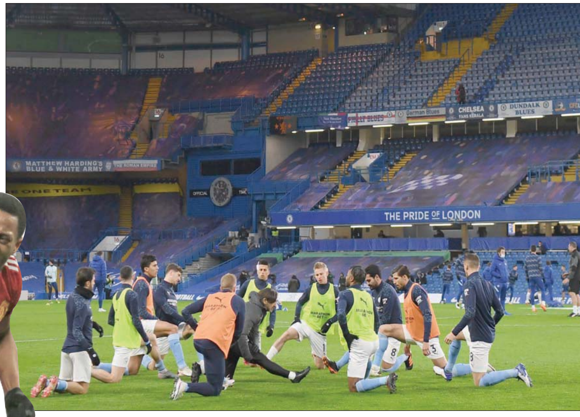
لاعبو سيدي أظهروا قوتهم في مواجهة تشيلسي السابقة ويتطلعون لتكرار ذلك بالديربي

وصوتت أندية الدوري الممتاز ضد إجراء خمسة تبديلات في كل مباراة هذا الموسم رغم تكديس الجدول لكن رابطة الأندية الإنجليزية قالت إنها تتشاور مع الفرق الأربعة المنتقبة في كأس الرابطة وتمت الموافقة على زيادة التبديلات إلى خمسة. ويذكر أن نهائي كأس الرابطة، الذي يقام عادة في فبراير (شباط) قد تأجل إلى 25 أبريل (نيسان) أصلا في حضور الجماهير حال احتواء تفشي فيروس «كورونا».