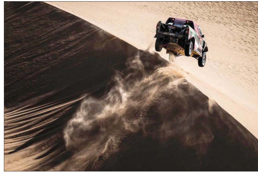
شاحنة صغيرة تواجه مرتفعاً رملياً خلال السباق

وأصبحت سيارة بيترهانسل، الذي يطلق عليه «السيد داكار» بسبب انتصاره 13 مرة في الرالي في فئة السيارات والدراجات