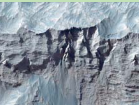
إحدى الصور التي تم نشرها لوادي مارينيريس

مرات، مما يجعله وادياً منفرداً في النظام الشمسي، وفقاً لعلماء جامعة أريزونا. وبالتزامن مع الكشف عن الصور الجديدة، نقل تقرير نشره موقع «لايف ساينس»، عن وكالة الفضاء الأوروبية قولها، إنه على عكس وادي غراندي كانيون على الأرض، والذي تم نحته من تدفق المياه، فمن المحتمل أن يكون السبب على الكوكب الأحمر مختلفاً، حيث إن مناخه حار