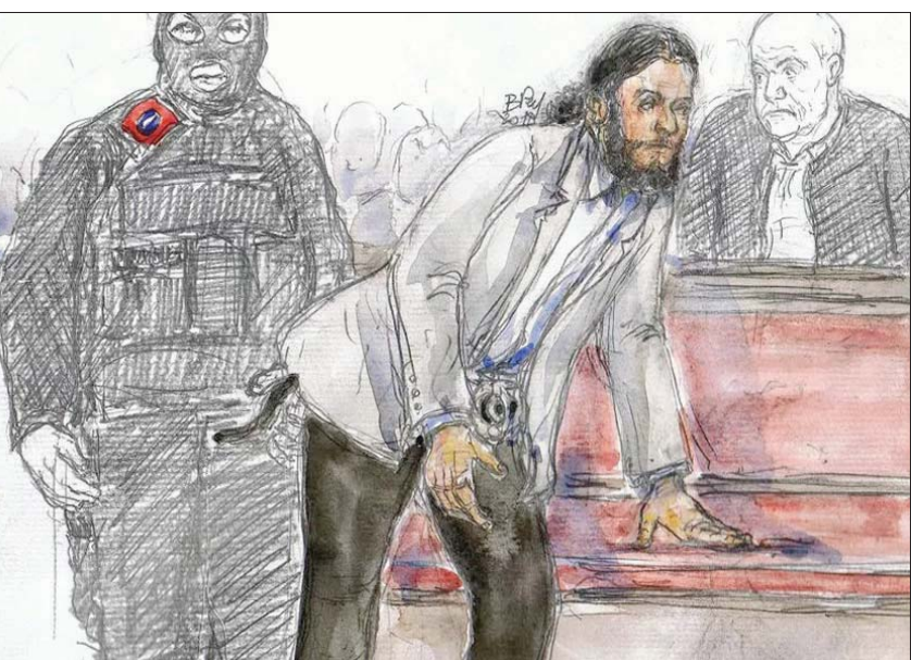
صلاح عبد السلام لدى مثوله أمام المحكمة في جلسة سابقة (أ.ب)

الثانية قبل 18 شهراً؛ إن يتعين على فرنسا أن تحاكم منفذي هجوم 13 نوفمبر، المقررة في باريس من 8 سبتمبر (أيلول) 2021 إلى نهاية مارس 2022. وتمت تهنية المقر الرئيسي السابق لحلف شمال الأطلسي في بروكسل، والذي يمتد على مساحة كبيرة فائقة الأمان، لاستيعاب الآلاف من الأشخاص المعنيين بهذه القضية الاستثنائية. وتعد المحاكمة المقبلة الثانية بالنسبة لعبد السلام بلجيكا. وحكم على هذا الفرنسي من أصل مغربي غيابياً في بروكسل في أبريل (نيسان) 2018 بالسجن 20 عاماً بتهمة محاولة قتل طابع إرهابي لمشاركتة في تبادل لإطلاق النار مع الشرطة في بروكسل في 15 مارس 2016، قبل ثلاثة أيام من توقيفه في مولديك، مسقطه في بلجيكا.