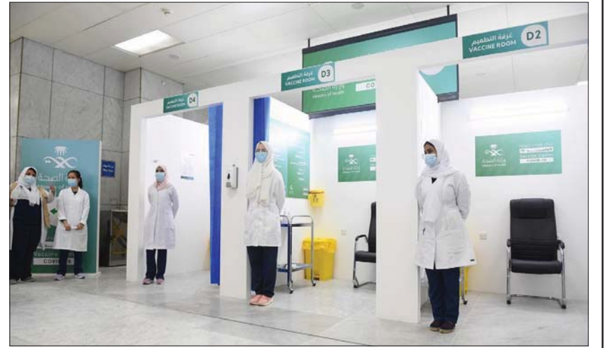
إقبال بين المواطنين والمقيمين لأخذ لقاح «كورونا»

الرياض، محمد العايض بدأ اليوم (الأربعاء) في السعودية توزيع الجرعة الثانية من اللقاح المضاد لفيروس كورونا (كوفيد - 19) للذين تلقوا الجرعة الأولى منذ بدء توزيع اللقاح منتصف ديسمبر (كانون الأول).