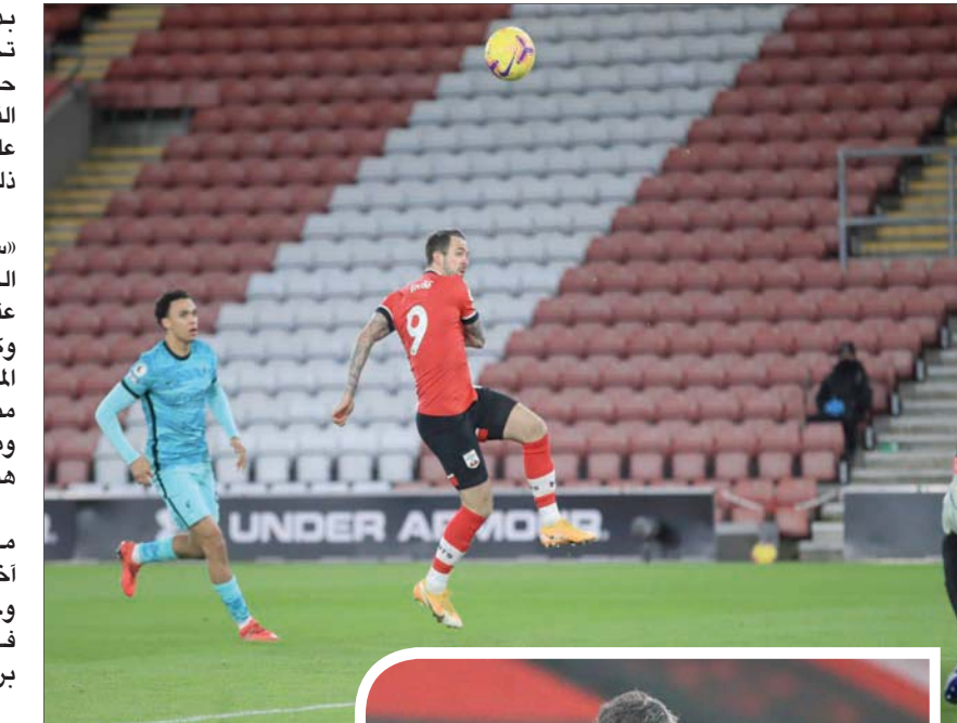
إنغز مهاجم ساوثهامبتون (في الوسط) يسدد بطريقة خادعة في مرمى ليفربول

وسيلعب ليفربول مع أستون فيلا في الدور الثالث لكأس الاتحاد الإنجليزي يوم الجمعة، قبل أن يصطدم بغريمه مانشستر يونايتد في 17 يناير بالدوري. في المقابل ظهر النمساوي رالف هازنهوتل مدرب ساوثهامبتون، يبكي فرحا وجنا على ركبتيه بعد صافرة النهاية وبعض الجماهير أن ساوثهامبتون انتزع لقب الدوري الممتاز بعد مشاهدة دموع الفرح للمدرب النمساوي، لكن في ظل ندرة فوز الفريق على ليفربول، حيث حقق انتصاره الأخير عليه في الدوري منذ نحو خمس سنوات، فإن ذلك كان يستحق أن يحتفل به هازنهوتل، الذي تولى منصبه في 2018 بشكل مختلف. وقال هازنهوتل مازحا، لهيئة الإذاعة البريطانية (بي بي سي): «كانت الدموع في عيني... بسبب الرياح... عندما تشاهد لاعبي فريقك يقاتلون بكل قوة لديهم، فهذا يجعلني أشعر بفخر شديد. يحتاج المرء إلى مباراة مثالية أمام ليفربول واعتقد أننا فعلنا ذلك». واضطر ساوثهامبتون للدفاع فترات طويلة خصوصا في الشوط الثاني. ورأى هازنهوتل أنه لم يشعر بإمكانية الخروج بهذا الفوز إلا بعد أن وصلت المباراة إلى الوقت