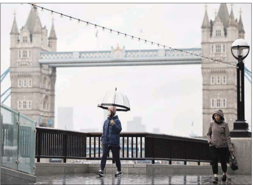
يبدو أن اقتصاد بريطانيا سينزلق في حالة ركود من جديد

الأحد، وصرح جونسون لشبكة «بي بي سي» البريطانية «قد نضطر في الأسابيع المقبلة لإتخاذ تدابير أكثر تشدداً في أنحاء عدة من البلاد».