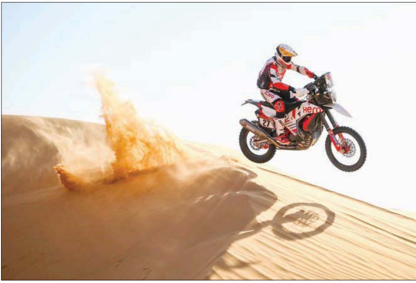
قائد دراجة نارية خلال منافسات المرحلة الثالثة أمس (الشرق الأوسط)

الناحية، بثقف في أحد الإطارات في بداية المرحلة واحتل المركز الثالث خلف الجنوب أفريقي هينكلانجان سائق تويوتا. واحتل ساينز المركز 21 في المرحلة الثالثة.