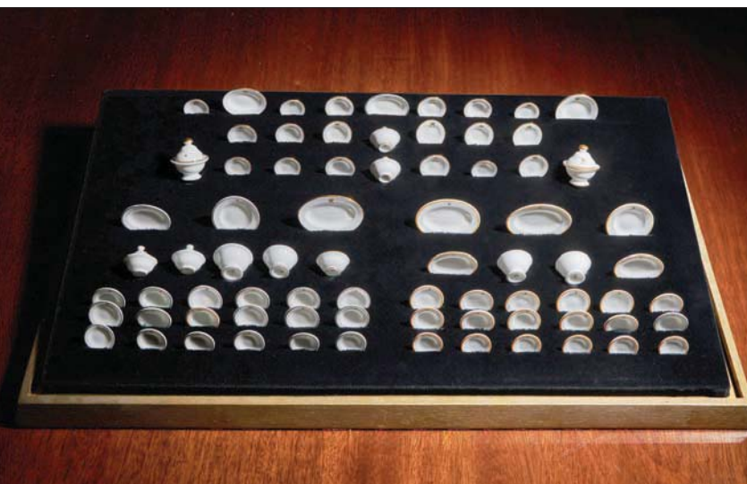
نسخة من طقم مصغر من أطباق الطعام صنع لبيت الدمية المعروض بقلعة ويندسور

وكالعادة احتفظت سجلات المحل بنسخة من كل قطعة صنعت لبيت الدمية، وسيقدم المزاد الأطعم الثلاثة مع خطاب شكر من الملكة ماري.