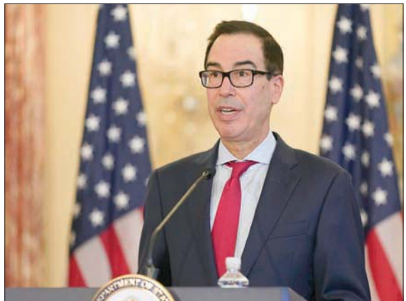
وزير الخزانة الأميركي ستيفن منوتشين

وعبرت في بيان أمس، عن أملها أن يسهم تطبيق القانون في تحقيق دعم الانتقال والمساعدة في تعزيز سلطة القانون وحقوق الإنسان والحكم الديمقراطي. وأشارت إلى أن القانون يتضمن برامج لتحفيز النمو الاقتصادي وإسناد السلام والاستقرار، يلتف حوله السودانيون، بكل قواهم الاجتماعية ومنطلقاتهم السياسية، لتحقيق تطلعاتهم وتأكيد خياراتهم. وفي منتصف ديسمبر (كانون الأول) الماضي، منحت واشنطن البنك الدولي، قرضاً بقيمة مليار دولار للمساعدة في سداد متأخرات ديون السودان. وستنتج اتفاقية «القرض الجسري» للسودان الحصول على تمويل من مؤسسة التنمية التابعة للبنك الدولي، يُعنى الاقتصاد السوداني المتعثر، حسبما أعلنت عن ذلك وزارة المالية. ويهدد رفع السودان من قائمة الدول الراجعة للإرهاب للحصول على 1,5 مليار دولار سنوياً مساعدات تنموية من مبادرة لدعم الدول الفقيرة المغفلة بالديون.