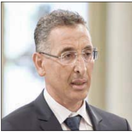
الوزير توفيق شرف الدين

أقال رئيس الحكومة التونسية هشام المشيشي، أمس، وزير الداخلية توفيق شرف الدين، دون ذكر أسباب القرار، الذي جاء في وقت تشهد فيه البلاد وضعاً سياسياً واجتماعياً غير مستقر. وقالت رئاسة الحكومة في بيان مقتضب، إن رئيس الحكومة هشام المشيشي «قرر إعفاء توفيق شرف الدين وزير الداخلية من مهامه، على أن يتولى رئيس الحكومة الإنتراف على وزارة الداخلية بالنيابة في انتظار تعيين وزير داخلية جديد». كانت عدة أحزاب سياسية قد عبرت عن رفضها تعيين المحامي السابق، توفيق شرف الدين، ووزير