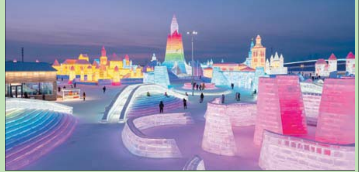
أشخاص ينظرون إلى منحوتات جليدية في مهرجان هارين للجليد والثلج في مقاطعة هيلونغجيانغ شمال شرقي الصين... وتعزف المنطقة بمنأخها البارد، مع شتاء قارس يستمر أربعة أو خمسة أشهر، ودرجات حرارة تنخفض بشكل مفاجئ إلى تحت الصفر... وتنتهي الصين هذه الفترة وهذه الأجواء لإقامة مهرجان هارين العالي للثلج والجليد، حيث تقام فيه منافسة للفوز بأجمل تمثال أو منحوتة أو مبنى من الجليد

باريس، «الشرق الأوسط» أوضح الزوجان، اللذان يملكان مزارع لتربية الحيوانات قريبة من بحيرة بوريجه، أن الماعز والظباء تجد لذة في مضغ الأعغان؛ حتى الشوكية منها، باستثناء الجنوح التي يتم طحنها للاستفادة منها الطبيعية التي كانت تتلألأ بالأضواء والزينات في البيوت، ويلقى بها على الأرصفة بعد انتهاء وظيفتها، نظراً لأنها مقطوعة عن جذورها ولا تصلح لإعادة زراعتها. هذه السنة أعلن زوجان مزارعان من مقاطعة سافوا، شرق البلاد، عن تجربة لإعادة تدوير أشجار الميلاذ التالفة؛ حيث اكتشفا أنها تصلح علفاً لقطعان الماعز التي يربيانها في المزارع. وهو علف مفيد لأنه يحتوي على كثير من الفيتامينات.