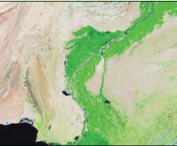
من الصور الصادمة (ناسا)

وأشار باحثون من المركز الوطني لبيانات الجليد والثلوج إلى أن عام 2020 شهد ثاني أدنى الانخفاض للجليد الجليدي في القطب الشمالي في تاريخ سجلات الأقمار الصناعية الذي يعود إلى 42 عاماً. من جهته، قال مارك سيرين، مدير المركز الوطني لبيانات الجليد والثلوج عندما صدرت الأرقام في سبتمبر (أيلول) 2020: «يتقلص الجليد في الصيف، ويصبح أقل سمكاً. نحن نقفد السبعينيات».