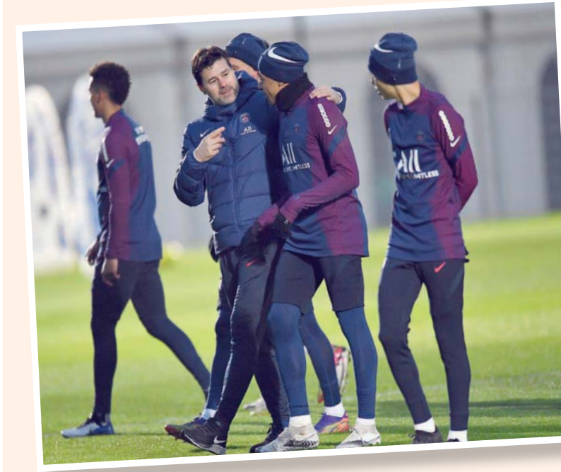
بوكيتينو يأمل أن يكون مشواره مع سان جيرمان أفضل من توخيل

باريس، «الشرق الأوسط» كان الأرجنتيني ماوريسيو بوكيتينو على علاقة جيدة بالأسطورةين مواطنيه الراحل دييغو مارادونا والبرازيلي رونالدنيو خلال أيامه كلاعب، والآن ستكون علاقته مع نجم عالمي آخر المهمة إلى البرازيلي فيابنيو وقائد الفريق جوردان هندرسون. ويعاني ليفربول من إصابات عدة في هذا الخط طالت الهولندي فيرجيل فان دايك والكاميروني جويل ماتيب وجو غوميز. في المقابل غاب عن ساوثهامبتون لاعبان مؤثران في صفوفه هما مهاجمه تشي آدمز الذي يعاني من ارتجاج في الدماغ، ولاعب الوسط المدافع أورويل روميو لإصابة في ركلة الساق، بالإضافة إلى الحارس اليكس ساكراتي لإصابته بفيروس «كورونا المستجد». لكن على ساوثهامبتون الاحتفاء بهدافه إنغز الذي سجل هدف اللقاء الوحيد بعد دقيقتي فقط من البداية عندما استغل خطأ لتراتن الكسندر أرنولد وسدد كرة ساقطة بشكل رائع من فوق الحراس البرازيلي الجيسون. والهدف هو الخمسون لإنغز في الدوري الإنجليزي الممتاز في 124 مباراة، والسابع له هذا الموسم. ولم تفلح محاولات ليفربول الذي شدد تعديله النتيجة لتصبح صدارة للبطولة مهددة.