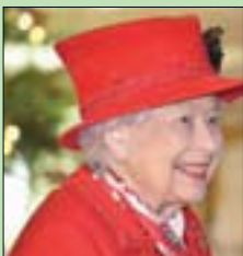
ملكة بريطانيا إليزابيث الثانية

لندن: «الشرق الأوسط» في القصر، حسب وكالة الأنباء الألمانية (د.ب.أ)، وذكرت «برس أسوسيشن»، أن بعض المسروقات تراوحت قيمتها بين 10 آلاف و100 ألف جنيه إسترليني (13 ألفاً و500 دولار) إلى 135 ألف دولار. وبساع الرجل المسروقات، بما في ذلك ميداليتان واليوم صور مادية ملكية للرئيس الأميركي دونالد ترمب، بقيمة أقل بكثير من قيمتها على موقع «إيباي». سجن موظف لمدة ثمانية أشهر بتهمة سرقة عشرات مقتنيات من قصر باكنغهام في لندن. وكان قد اعترف الرجل (37 عاماً) بثلاثة اتهامات بالسرقة، حسب ما ذكرته وكالة «برس أسوسيشن» البريطانية. وعثرت الشرطة على «كمية كبيرة» من المسروقات خلال تفتيش مقره في القصر منذ عام 2015.