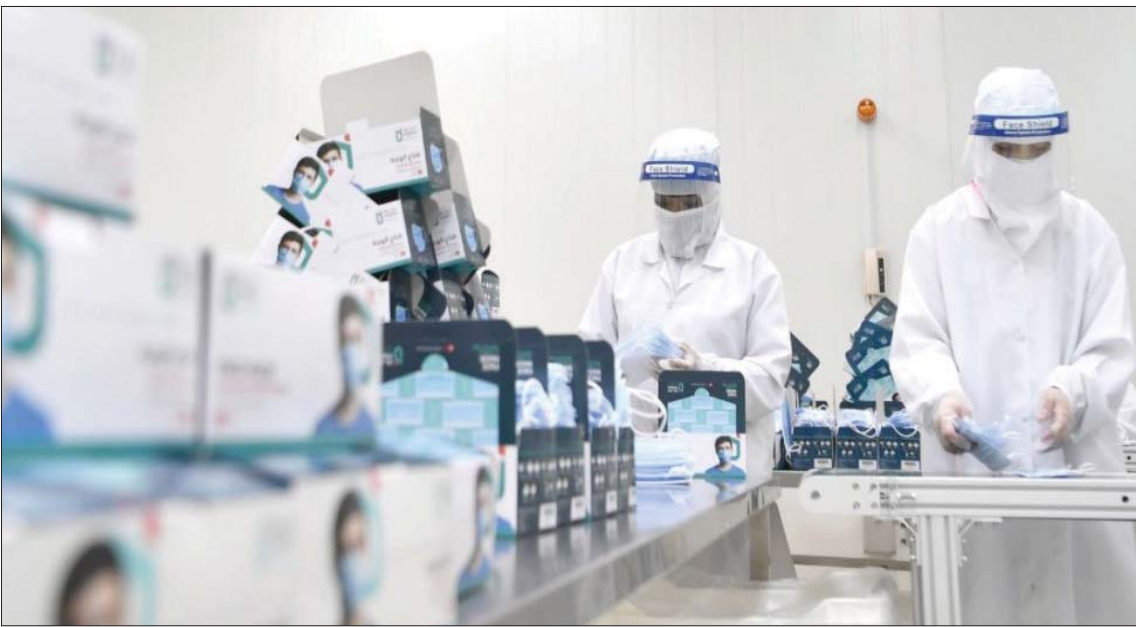
السعودية تسجل أعلى نمو في أنشطة الأعمال منذ أكثر من عام متخطية آثار الجائحة (الشرق الأوسط)

وأفاد التقرير بأن الأعمال الجديدة ارتفعت أيضاً في ديسمبر الماضي بوتيرة أكثر وضوحاً مقارنة بمعدل التوسع الطفيف في نوفمبر 2020، حيث إن مؤشر مديري المشتريات الرئيسية سجل أقل من المستوى الحامد، 50 نقطة، من جانب التفاؤل إلى آخر لأحد أكبر اقتصادات الخليج، ارتفع مؤشر مديري المشتريات الرئيسي لدولة الإمارات، التابع لمجموعة خلال ديسمبر الماضي إلى 51,2 نقطة من 49,5 نقطة، مقارنةً بالشهر السابق نوفمبر، ما يعطي دلالة واضحة على تحسن متجدد في أداء القطاع.