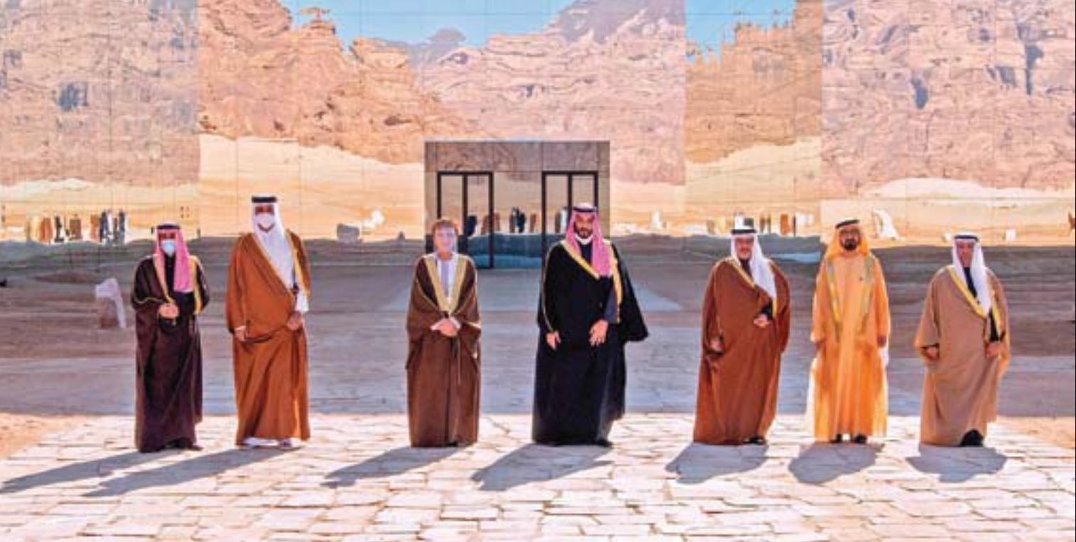
القادة وممثلو مجلس التعاون لدول الخليج العربية في العلا قبل بدء الاجتماعات الرسمية أمس

في المفاوضات التي جرت بشأن المصالحة مع قطر مما أدى إلى تحقيق هذا الهدف. ورحب الأمين العام لجامعة الدول العربية أحمد أبو الغيط بمخرجات القمة، معتبراً أن «أي الأجواء العربية ويضغ في صالح النظام العربي الجماعي محل ترحيب». وأكد المتحدث باسم الممثل الأعلى للأمن والسياسة الخارجية في الاتحاد الأوروبي، جوزيب بوريل، التوصل إلى حل خليجي، مثنياً للجهود التي بذلتها الكويت لإنجاز المصالحة. (تفاصيل ص 2 و3)