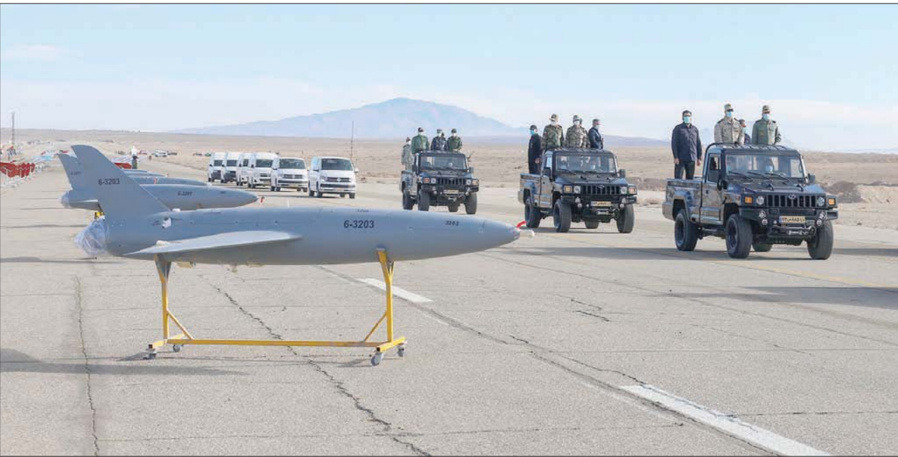
رئيس الأركان محمد باقري يزور قاعدة عسكرية قبل لحظات من انطلاق مناورات للطائرات المسيّرة في محافظة سمنان شرق طهران أمس

وأوضح أن وزارة الخارجية عاقبت شركة «سي إف سي سي» الصينية، وشركة «إتش دي آي إس سي أو» الإيرانية، إثر قيامها ببيع الجرافيت أو توريده بشكل مباشر، إلى أو من إيران، وتم بيع هذا الجرافيت أو توريده أو نقله ممن يمكنهم النظام من تمويل وتنفيذ أجهزته الخبيثة المتمثلة في القمع والإرهاب.