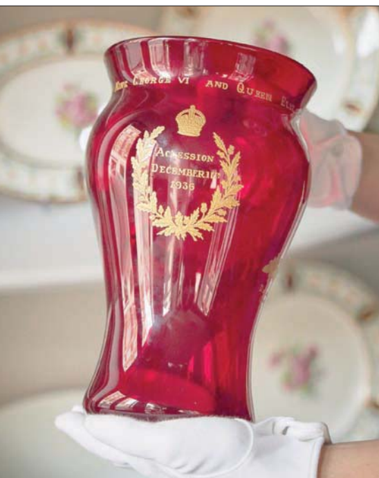
«المزهية الحمراء» صنعت لتسجيل تتويج الملك جورج السادس (سويديز)

من القطع الطريفة في المزاد طقم خاص صنعه توماس غود ليوضع في غرف بيت الدمية الخاص بالملكة ماري في قلعة ويندسور، وهو من القطع البارزة في مجموعة القطع الملكية «روبال كوليكتشن». ويعتبر بيت الدمية في قلعة ويندسور أكبر وأشهر بيت دمي في العالم، يبلغ ارتفاعه خمسة أقدام ومزود بتوصيلات الكهرباء والماء. البيت به كل التفاصيل الدقيقة مثل الصنابير المصنوعة من الفضة والثريات المصغرة ومجموعات كتب مصغرة. عمل في تصميم وتنفيذ البيت حوالي 1500 حرفي لصناعة كل عناصر البيت بدقة الحجم، من هؤلاء توماس غود الذي كلف في عام 1922 بصناعة طقم طعام من البورسلين من 76 قطعة وزعت على غرفة الطعام الرئيسية وغرفة الحضانة والمطبخ.