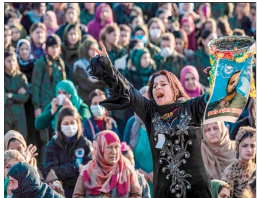
تشيع عنصر من قوات «الأسايش» الكردية في القامشلي بحفاظة الحسكة أول من أمس

لجأ عرقياً يعمل لـ«الأسايش» من خلال إطلاق مجهولين النار عليه أمام خيمته، لافتاً إلى وقوع اشتباك بين عناصر «الأسايش» والمسلحين المهاجمين، وأفاد بأن قوات الأمن اعتقلت أحد المهاجمين فيما أصيب أحد عناصرها. وفي 3 يناير (كانون الثاني) الحالي، أفاد «المركز» بمقتل لائحة عراقية يطلق ناري أثناء وقوعها أمام خيمتها في القسم الخامس من «دويلة الهول»، وذلك في إطار «الغوض المتواصلة» ضمن المخيم الواقع في ريف الحسكة الجنوبي الشرقي. كما تعرضت لائحة عراقية أخرى ضمن المخيم لعملية اغتيال في 28 ديسمبر (كانون الأول) الماضي من خلال إطلاق النار عليها أمام