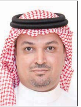
الروائي محمد حسن علوان الرئيس التنفيذي لهيئة الأدب والنشر والترجمة