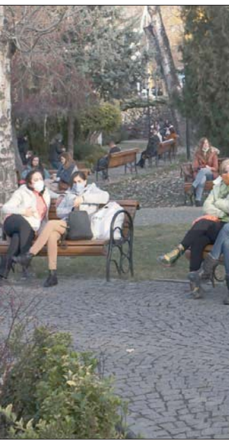
مواطنون في حديقة عامة بأقترعة يوم الجمعة

وقال تشغلار إنه قرر وقف استثماره لأن النهج التحريري للمقابلة قريب جداً من المعارضة الموالية للأكراد، لكن رئيس تحرير القناة بدتيمه بأنه خضع ببساطة لضغوط الحكومة.