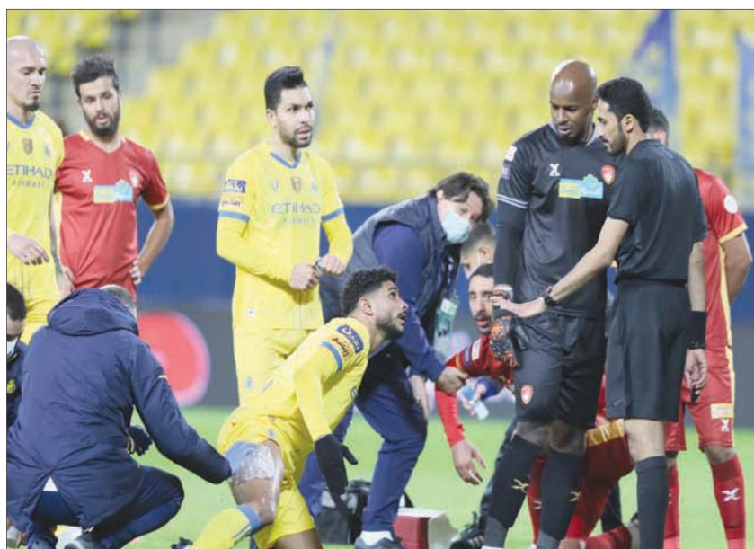
فرص ضحك التعادل على النصر في المواجهة التي جمعتهم أمس

مارتينز يحتفل بهدف الشباب في شباك الباطن أمس