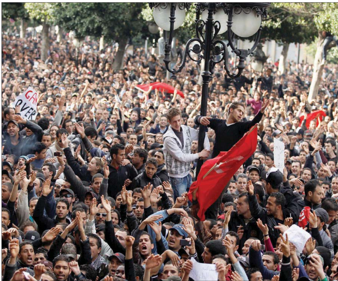
جانب من المظاهرات ضد نظام حكم الرئيس الأسبق زين العابدين بن علي في يناير 2011

النهضة» و«قلب تونس» واتهمها بالفساد المالي والإداري وبحتمل مسؤولية «إجهاض مسار الثورة والتغيير والإصلاح». كذلك، طالب عبو بتوقيف «الفاستين» من قيادات الحزبين «إيداعها والسجن». وهكذا، يشهه مراقبون التنافس الحالي بين قصري قرتاج (مقر رئيس الجمهورية) والقصبة (مقر رئيس الحكومة) في استخدام ورقة محاربة الفساد المالي بالحملة التي قادها رئيس الحكومة الأسبق يوسف الشاهد، عام 2017. ضد عدد من المسؤولين ورجال الأعمال الذين أنذرتهم واتهمهم بالفساد في سياق معركة مع الرئيس السابق الراسل الباجي قائد السبسي ونجله حافظ وبعض المقربين منهما.