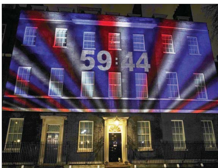
في 31 يناير (كانون الثاني) 2020 خرجت بريطانيا من الاتحاد الأوروبي، منهية ارتباطاً بجيرانها الأوروبيين دام 47 عاماً ضمن هذا التكتل العملاق الذي يضم 500 مليون نسمة. وفي الصورة، أنوار مسلطة على مقر رئاسة الوزراء في 10 داوونينغ ستريت بلندن تشير إلى ساعة العد التنازلي لبدء «بريكست»، الذي توج نهاية هذه السنة بانتهاء مرحلة انتقالية دامت سنة بقت بريطانيا خلالها خاضعة للقوانين الأوروبية