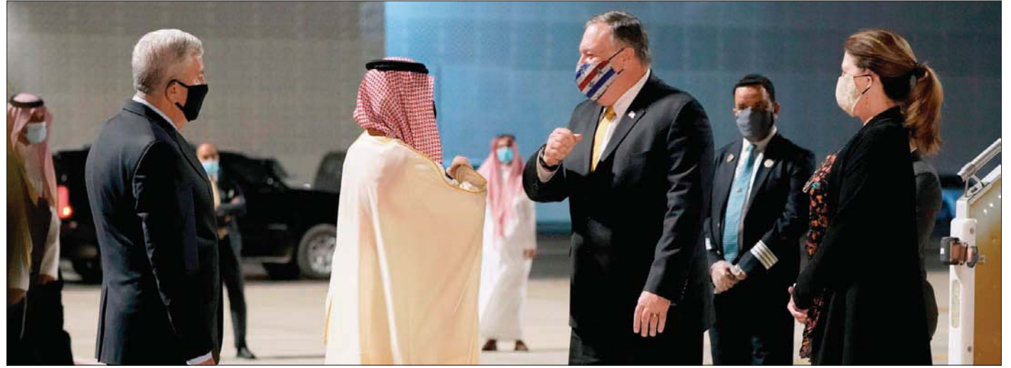
وزير الخارجية السعودي الأمير فيصل بن فرحان لدى استقباله نظيره الأمريكي مايك بومبيو في نيوم يوم 22 نوفمبر 2020