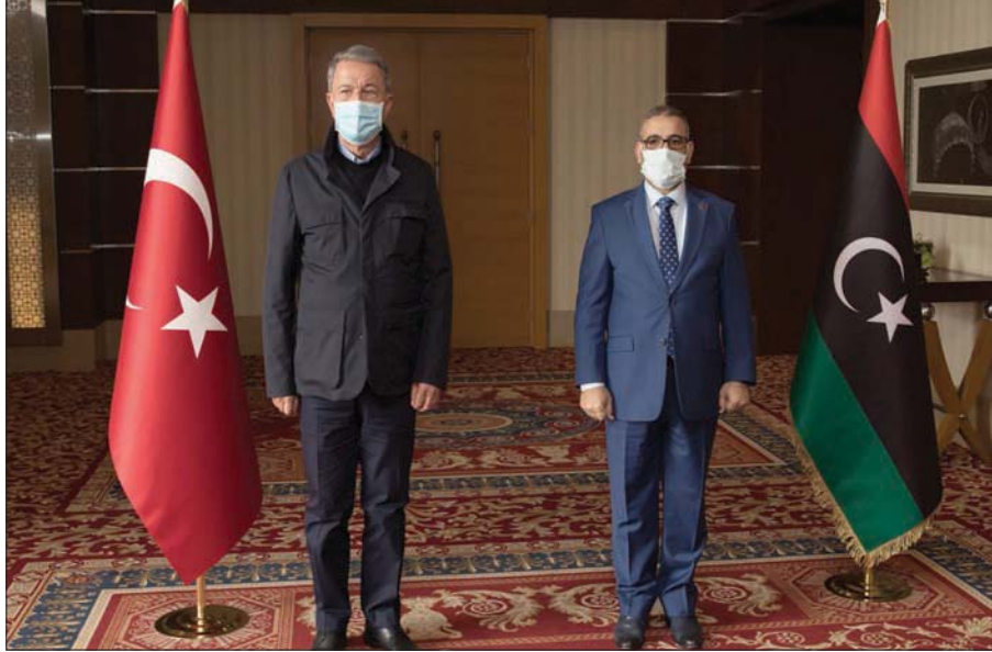
خالد المشري خلال استقباله لخلوصي أكار لدى وصوله أمس إلى طرابلس

ولم تعلن مصر رسمياً عن الزيارة، لكن أحدث مباحثات أجراها مسؤول مصري رفيع المستوى في ليبيا، قام بها رئيس المخابرات المصرية، الوزير عباس كامل، أمس (الأحد)، والتقى خلالها قائد «الجيش الوطني» الليبي، في بنغازي. وأفاد بيان مصري أن كامل نقل «رسالة دعم وتأييد من الرئيس المصري عبد الفتاح السيسي للشعب الليبي على مختلف الأصعدة العسكرية والسياسية، في إطار الدور المصري الداعم لاستقرار الأوضاع في ليبيا، والحفاظ على مقدراتها ومكتسباتها».