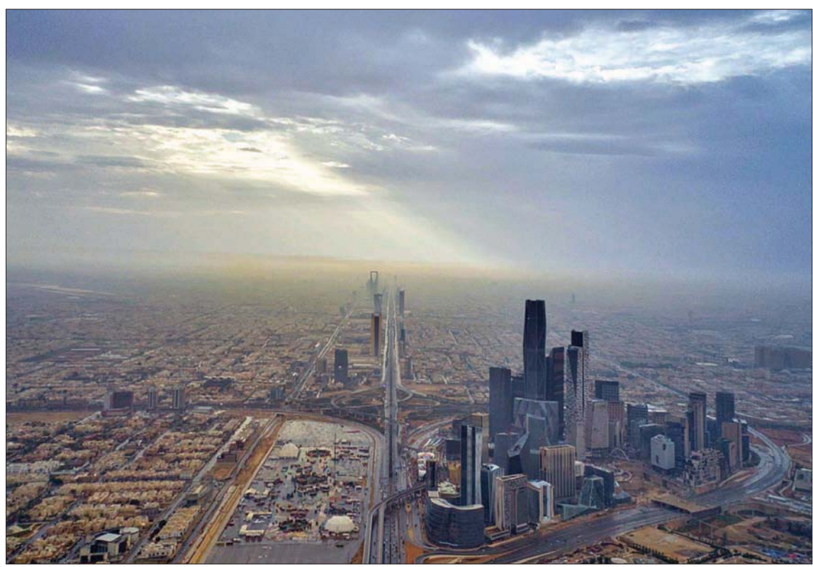
تعمل السعودية على زيادة قاعدة التنوع الاقتصادي لمواجهة أي متغيرات عالمية (واس)

من ناحيته قال الأكاديمي الدكتور أسامة بن غانم العبيدي أستاذ القانون التجاري الدولي بمعهد الإدارة العامة بالرياض، في حديثه لـ «الشرق الأوسط»، إن سياسات كفاءة الإنفاق ومكافحة الفساد وتنويع مصادر الدخل التي تبنتها رؤية السعودية 2030، ساهمت في الحد من الأثر