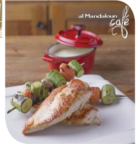
من أطباق كافيه مندلون

عند المدخل الرئيسي يقف أحد العاملين يقيس حرارة الزائر، ومن بعدها لا يُسمح له بالجلوس على الطاولة التي يختارها، بعد أن يجري تعقيمها مع كراسيها. تلتف أشعة الشمس هذا الركن، ليشكل استراحة المحارب لإعلاميين ورجال