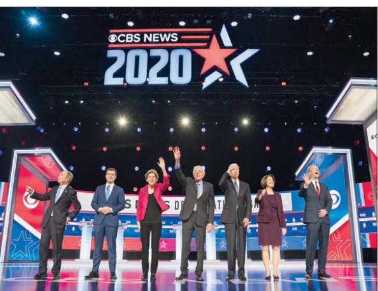
طريق جو بايدن إلى البيت الأبيض... تمر في ولاية كارولينا الجنوبية... 25 فبراير (شباط) 2020، استضافت هذه الولاية المناظرة العاشرة بين المرشحين الديمقراطيين في إطار الانتخابات الحزبية التمهيدية. ضمت قائمة المرشحين في تلك المناظرة، من اليسار، مايك بلومبرغ، وبيت بوتيدجيدج، وإلزابيث واين، وبيترني ساندرز، وجو بايدن، وإيمي كلوشار، ورجل الأعمال توم ستاير

من جهته، يتفق مسفر السبيعي، مدير عام «مركز الأدب العربي» السعودي، مع زملائه على تقلص حجم المبيعات خصوصاً المبيعات المحضنة عن طريق المتاجر الورقية، لكن في المقابل، كما يضيف، ارتفعت أرقام المبيعات عن طريق مناجر «الأون لاين»، حيث أصبحت تمثل بديلاً متنعماً للقارئ للحصول على كتابه الورقي، مع نمو الطلب على النسخة الإلكترونية للكتب من منصات التحميل المختلفة