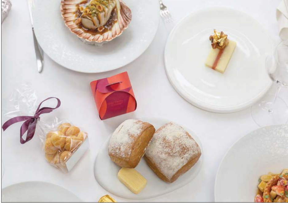
تشكيلة من أشهر الأطباق لدى «إيلين داروز»