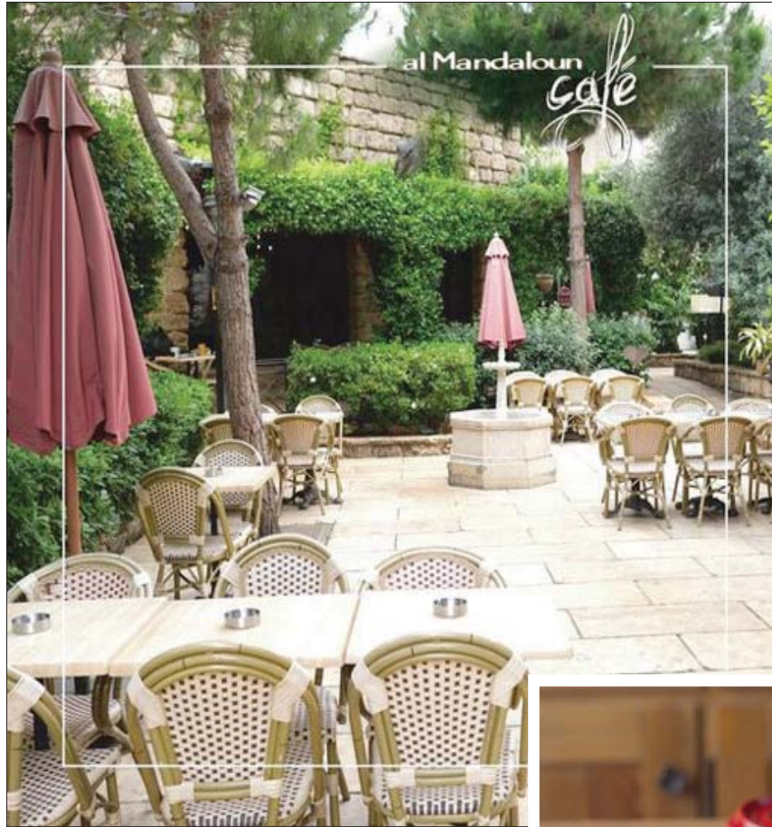
جلسة في الخارج تناسب الالتزام بالتباعد الاجتماعي والقانون الخاص بالسلامة

وتعد ذلك في إمكان اختيار أطباق إيطالية أخرى تتراوح بين الباستا وسمك السلمون وكذلك شرائح الإسكالمون المتنوعة من لحم البقر والدجاج. كما تحضر لائحة من أطباق «كيش» على طريقة المندلون، أو تلك التقليدية المعروفة بـ«الورين» المحشوة بالخضار والصعتر.