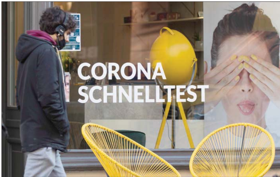
ملصق في برلين للتوعية بمخاطر «كوفيد - 19»

تداعيات الجائحة على الصحة العقلية بالبيانات الاجتماعية والديمقراطية، وغيرها من العوامل التي تساعد على وضع خطط استجابة فعالة خلال هذه الجائحة، واستعداداً للمستقبل. وبينما حذرت منظمة الصحة العالمية من تداعيات الجائحة على الصحة العقلية والنفسية للأطفال والشباب، بسبب إغلاق المدارس وتغيير النمط التعليمي، ذكرت أيضاً أن الاضطرابات العقلية تشكل 16 في المائة من الأمراض التي يعاني منها الذين تتراوح أعمارهم بين العاشرة والتاسعة عشرة، ويشكلون 17 في المائة من سكان العالم. وأشارت في بيان إلى أن نصف الاضطرابات العقلية تبدأ في سن الرابعة عشرة أو قبلها، وأن 90 في المائة من هذه الحالات لا تُشفي أو لا تعالج، وأن الاكتئاب هو السبب الأول في هذه الاضطرابات، متذكراً بأن الانتحار هو