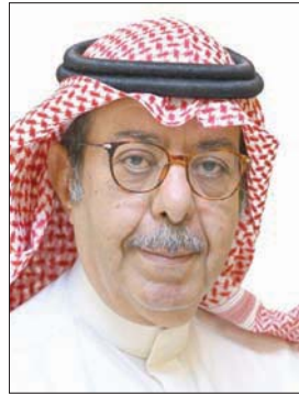
سلطان بن عبدالعزيز آل سعود، الرئيس التنفيذي لهيئة المسرح والفنون الأدائية

والهيئات الجديدة هي: هيئة الأدب والنشر والترجمة، وهيئة الأزياء، وهيئة الأفلام، وهيئة التراث، وهيئة فنون العمارة والتصميم، وهيئة الفنون البصرية، وهيئة المتاحف، وهيئة المسرح والفنون الأدائية، وهيئة المكتبات، وهيئة الموسيقى،