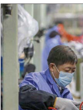
تتوقع الصين نمواً اقتصادياً متوسطه 5,7% سنوياً بين 2021 و2025 (أ.غ.ب)

مشروع قانون تمويل حكومي لسد هذه الفجوة قبل ذلك.