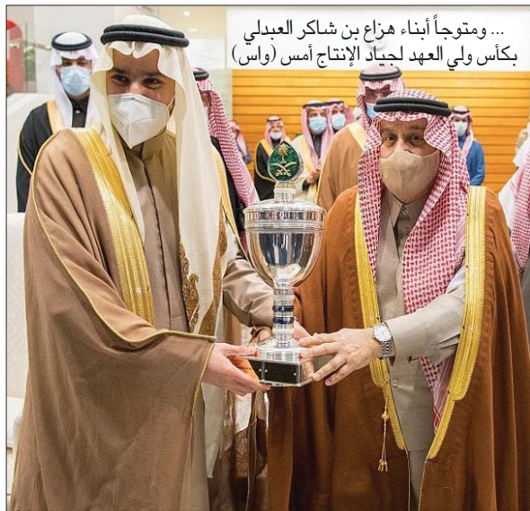
... ومتوجاً أبناء هزاع بن شاكر العبدلي بكأس ولي العهد لجياد الإنتاج أمس (وأس)