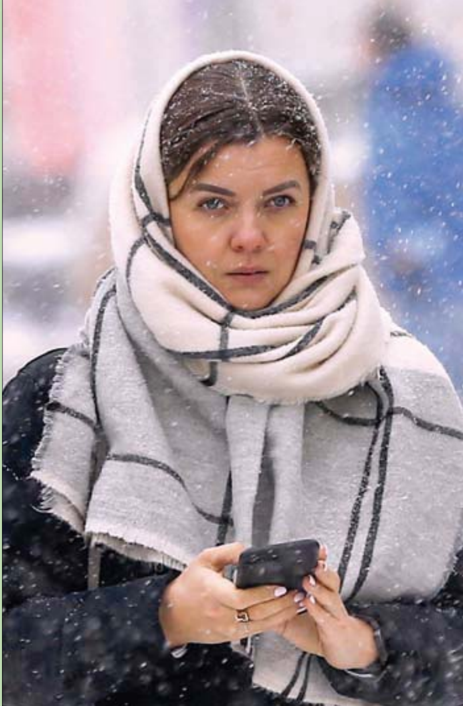
روسية تمشي في شارع كورننسكي موست أثناء تساقط الثلوج في موسكو خلال أعياد الميلاد

لا هزيمة ولا انتصار. هدية عادية في زمن غير عادي. فقد نام الملايين بعد الاتفاق مطمئنين إلى أن بريكست لن يغير الكثير في حياتهم ولن يقلبها رأساً على عقب كما كانوا يتخوفون. وفي ذلك - كما قلنا - راحة للجميع. وفي أي حال ما كان ينقص هذا العالم البائس بؤس آخر. لقد كسر اتفاق بريكست شؤم العام المشؤوم.