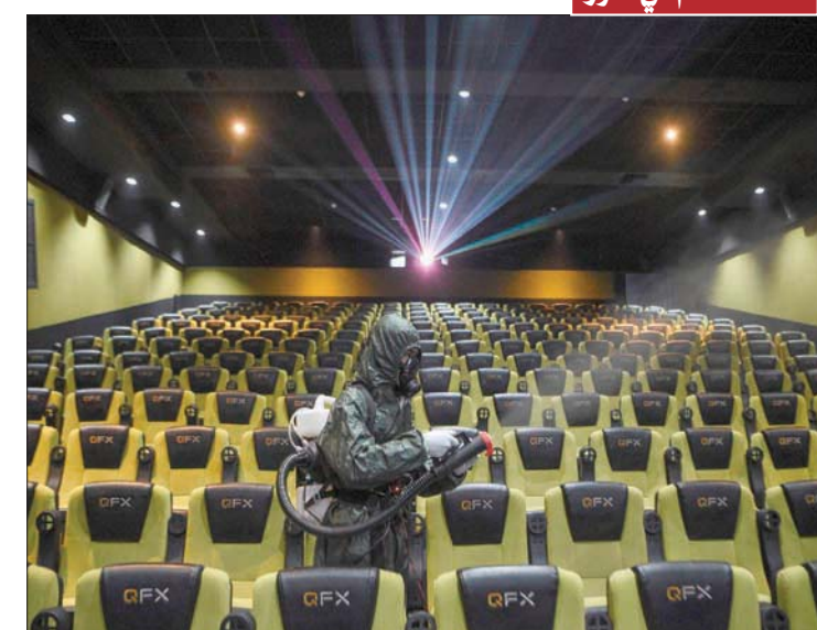
الحق فيروس «كورونا» أضراراً جسيمة بقطاع السينما حول العالم خلال عام 2020 وأدى إلى توقف صناعة الأفلام إلى حد كبير وتأجيل إصدار الأفلام الجديدة الجاهزة للنزول إلى الأسواق نتيجة إغلاق دور السينما وبالتالي غياب المردود المالي. وفي الصورة عامل يعقم قاعة في دار سينما في كاتماندو عاصمة نيبال استعداداً لعرض أول فيلم بعد الإغلاق في 24 ديسمبر الجاري