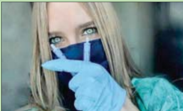
المشروع يجمع لقطات لآلاف البشر في العالم وهم يرتدون الكمامة

مشروع يجمع لقطات لآلاف البشر في العالم وهم يرتدون الكمامة