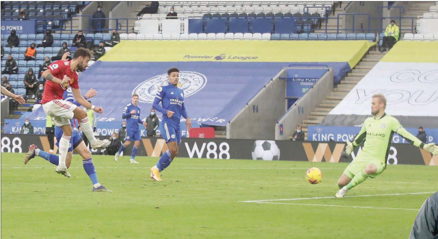
فيرنانديز نجم يونايتد يسجل ثاني أهداف فريقه في مرمى ليستر لكن الفريق سقط في فخ التعادل بالنهاية

والأكيد أن جميعنا تأثر بفيروس كورونا بشكل أو بآخر. لقد غير هذا الوباء جميع مناحي الحياة الشخصية والعملية على حد سواء. من كان يتخيل قبل عام من الآن أن العالم سيتغير بهذا الشكل؟ نعيش إغلاقاً، ولن يتمكن أحد من السفر؛ والأهم أننا لن نستطيع رؤية أحبائنا؛ لكن هناك جانب الخير في البشر ودعمهم الهائل لبعضهم البعض في الأزمات... أود أن أشكر كل العاملين في القطاع الصحي في كل أنحاء العالم، الإطباء... كذلك تحدثت كلوب عن تتويج ليفربول للمرة الأولى خلال 30 عاماً، قائلاً: «بالطبع، عندما ننظر إلى عام 2020 اليوم وبعد سنوات من الآن، سيذكر الجميع هذه الكلمات: ليفربول أبطال إنجلترا... وقعتها جميل على الآن، ليس كذلك».