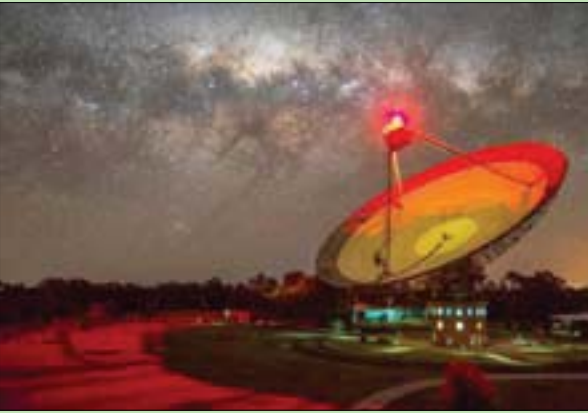
تلسكوب «باركس» في أستراليا

حجبتها أيضاً بانها إشارة تحمل توقيعاً تقنياً، لذلك ستكون هذه الإشارة الغامضة هي ثاني الإشارات من هذا النوع. ولم يتم التوصل إلى أصل الإشارة التي تم تسجيلها قبل 43 عاماً، ويأمل الباحثون هذه المرة أن يتمكنوا من الوصول إلى أصل الإشارة خلال الدراسة التي يتم إجراؤها حالياً، ليتم نشرها بإحدى الدوريات العلمية.