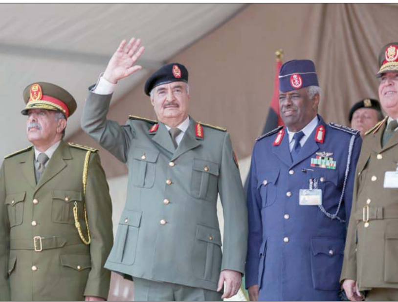
المشير حفتر يحيي عناصر «الجيش الوطني» بمناسبة احتفاله بذكرى الاستقلال في بنغازي

كما اتهمت ماريا واشنطن بـ«استغلال وضعها كعضو دائم في مجلس الأمن الدولي، لمنع تعيين رئيس جديد للبعثة».