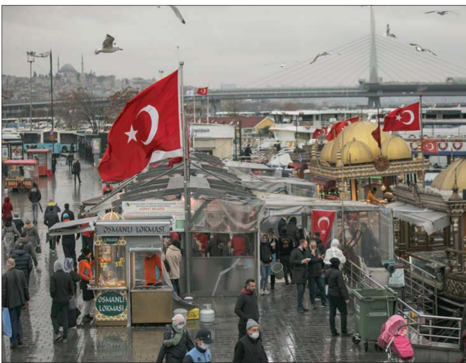
يتمثل «مثلث الشر» وفق إردوغان في أسعار الفائدة والتضخم وأسعار الصرف (أ.ب)

وعبر إردوغان عن أمله في تجاوز الاقتصاد التركي الصعوبات التي خلفها وباء كورونا في أقرب وقت، مشدداً على عزمهم في تسريع الإصلاحات، وإفصال ثلاثي الشر (الفائدة وأسعار الصرف والتضخم)، وإنشاء نظام قائم على الإنتاج والتوظيف.