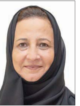
جهاد الخالدي الرئيسة التنفيذية لهيئة الموسيقى