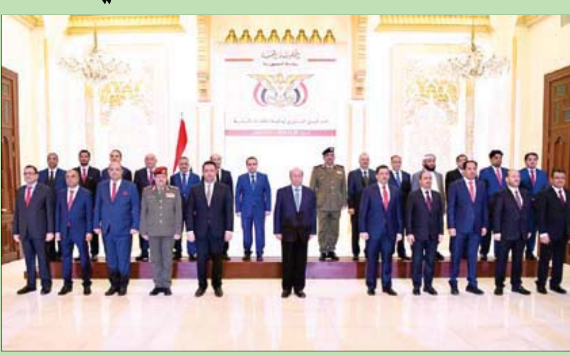
الرئيس هادي متوسطاً رئيس وأعضاء الحكومة اليمنية الجديدة بعد أداءهم اليمين الدستورية أمس

أدت الحكومة اليمنية برئاسة الدكتور معين عبد الملك، في الرياض، أمس، اليمين الدستورية، بعد أيام من قرار جمهوري أصدره الرئيس اليمني عبد ربه منصور هادي، بتشكيل الحكومة الجديدة، التزاماً بتنفيذ الشق السياسي من اتفاق الرياض الذي سبق شقة العسكري.