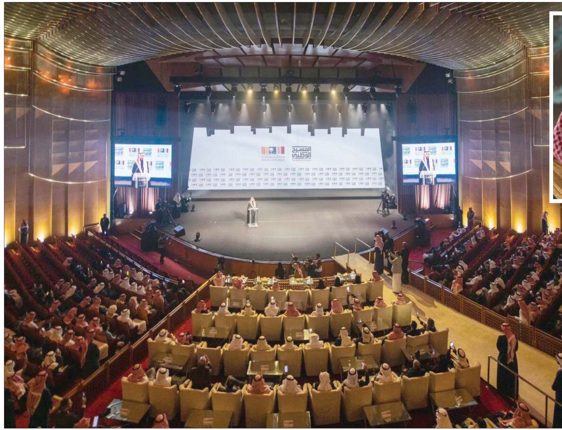
انطلاق نشاط مبادرة المسرح الوطني في مركز الملك فهد الثقافي بالرياض

ومن الفعاليات المهمة التي شهدتها السعودية خلال فترة الحجر الصحي، تنظيم «مهرجان أفلام السعودية» في الظهران، في الأول من سبتمبر (أيلول) 2020، حيث تحول المهرجان الذي نظّمته «جمعية الثقافة والفنون» بالدمام، بالشراكة مع «مركز الملك عبد العزيز الثقافي العالمي» بالظهران (إثراء)، وبدعم من هيئة الأفلام التابعة لوزارة الثقافة، في دورته السادسة إلى العالم الافتراضي، وتم نقل فعالياته جميعاً من خلال المنصات الإلكترونية عبر الإنترنت، وقناة «يوتيوب»، عرض المهرجان 54 فيلماً، بينها 32 فيلماً روائياً، و13