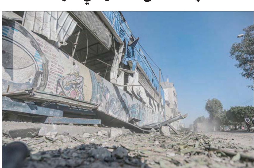
آثار الدمار على أحد مصانع المشروبات الغازية في قطاع غزة بعد تعرضه لغارة إسرائيلية

وكان وفد إسرائيلي - أميركي مشترك، أجرى مباحثات في العاصمة المغربية، الرباط، الثلاثاء الماضية، بعد رحلة جوية مباشرة لشركة «إل عال» من تل أبيب إلى الرباط. ووصف نتنياهو هذه الرحلة الجوية بأنها «اختراق طريق» وأمل أن تسرع تطبيع العلاقات بين الدولتين. بينما قال كبير مستشاري الرئيس الأميركي وصهره، جاريد كوشنر، «إننا ندفع اتفاقيات أبراهام باعتزاز بواسطة الرحلة الجوية التجارية المباشرة الأولى بين