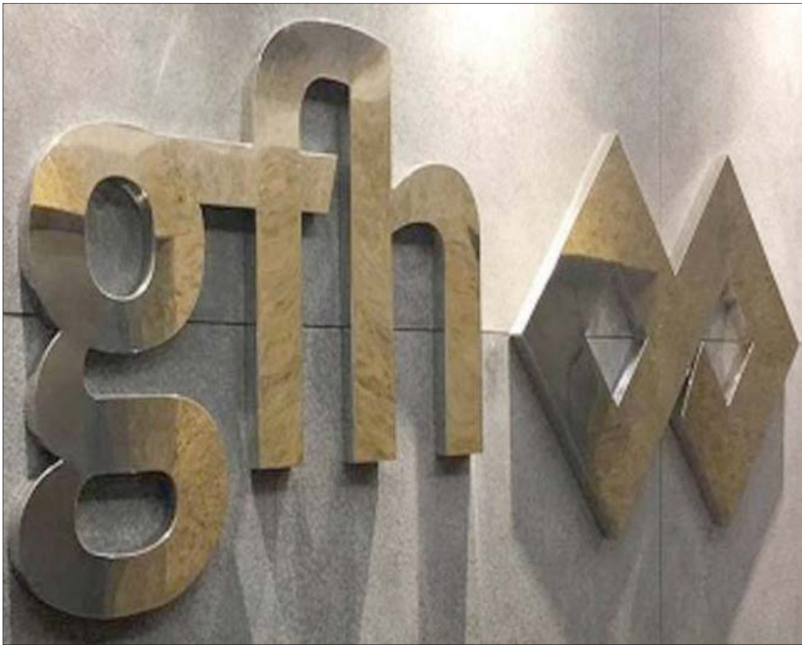
تتطلع «جي إف إتش» للاستفادة من قطاع العقارات والقطاع اللوجيستي في أوروبا وبريطانيا اللذين أظهرتا مقومات قوية وأفاقاً للنمو المستقبلي