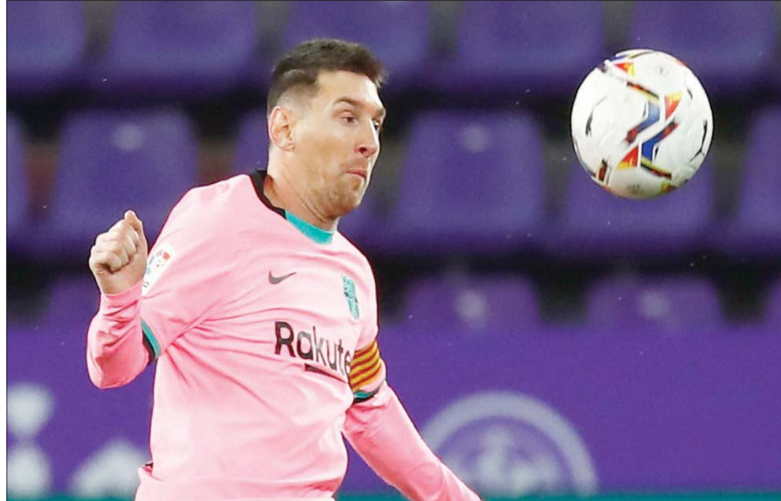
جمامير برشلونة تنتظر شهر يناير بقلق خشية توقيع ميسي لناد آخر

ميونخ الألماني في دور الثمانية الموسم الماضي. وفي الوقت الذي سادت فيه التوقعات بإجراء تغييرات جذرية في النادي الكتالوني قد يكون منها رحيل بارتوميو نفسه من منصبه، أشعل رئيس النادي فتيل أزمة أكبر بالتزامن مع بداية مسيرة المدرب الجديد الهولندي رونالد كومان باتخاذ قرار الإطاحة برموز الفريق من اللاعبين المخضرمين بحجة خطة إعادة البناء، وكان من بين هؤلاء النجوم الكرواتي إيفان راكيتيتش والتشيلي أرتورو فيدال والهداف الأوروغوياني لويس سواريز. وكان رحيل الأخير بمثابة شرارة الأزمة الجديدة بين ميسي وإدارة بارتوميو لا سيما أن المهاجم الأوروغوياني الدولي هو الصديق المقرب إلى ميسي كما أن مستواه لم يكن بالشكل الذي يدفع برشلونة إلى الإطاحة به بهذه السرعة والدليل المستوي الجيد الذي يقدمه اللاعب حالياً مع فريق أتلتيكو مدريد. وتتردد أن سواريز علم