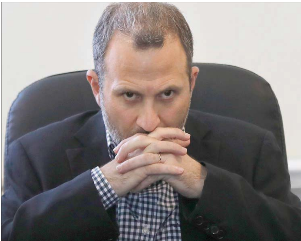
جبران باسيل (أب)

وبكلام آخر، فإن باسيل يراهن أيضاً على أن تصديه لتشكيل الحكومة سيؤدي إلى تراجع الاهتمام الدولي بلبنتان لصالح التفاوض الأميركي - الإيراني الذي يعيد له الاعتبار، بدءاً بإعادة النظر بالعقوبات المفروضة عليه، انتهاءً بإحداث خلل في ميزان القوى يعيده للمنافسة على رئاسة الجمهورية، بدعم من «حزب الله» الذي كان وراء تعطيل جلسات انتخاب رئيس الجمهورية، ولم يفرج عنها إلا بعد أن أيقن إيصاح عون إلى سدة الرئاسة.