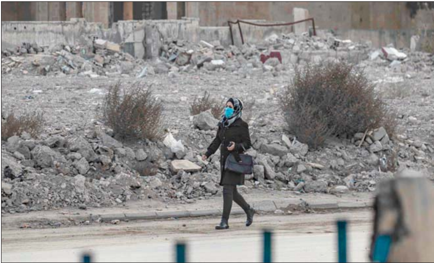
امرأة تحتفي من «كورونا» بكامية في الرقة شمال شرقي سوريا في 20 الشهر الجاري

في بيان أمس، إن قواتها قتلت 5 من عناصر وحدات حماية الشعب الكردية، أكبر مكونات «قسد»، أثناء محاولة للتسلل في المنطقة التي تعرف ب«نبع السلام» التي تسيطر عليها القوات التركية والفصائل الموالية لها في شرق الفرات، شمال شرقي سوريا.