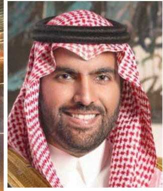
الأمير بدر بن عبد الله بن فرحان وزير الثقافة

أصابنا جائحة «كورونا» المستجد النشاط الثقافي في عام 2020، لكنها لم تنجح في شل حركته أو إدخاله دائرة «الحجر»، مثلما دخل ملايين البشر، وبينهم المثقفون. في عام 2020، تم إيقاف وتأجيل العديد من الفعاليات المهمة، مثل معرض الرياض الدولي للكتاب، وهو من أهم المعارض عربياً، وكان من المقرر أن يقام في واجهة الرياض خلال الفترة من 2 إلى 11 أبريل (نيسان) 2020.