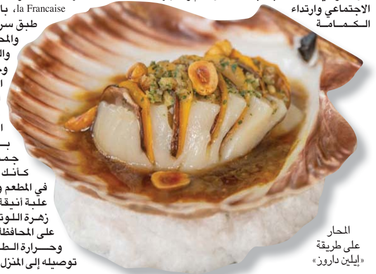
المحار على طريقة «إيلين داروز»

وجهة اللبنانيين من سياسيين وإعلاميين وفنانين