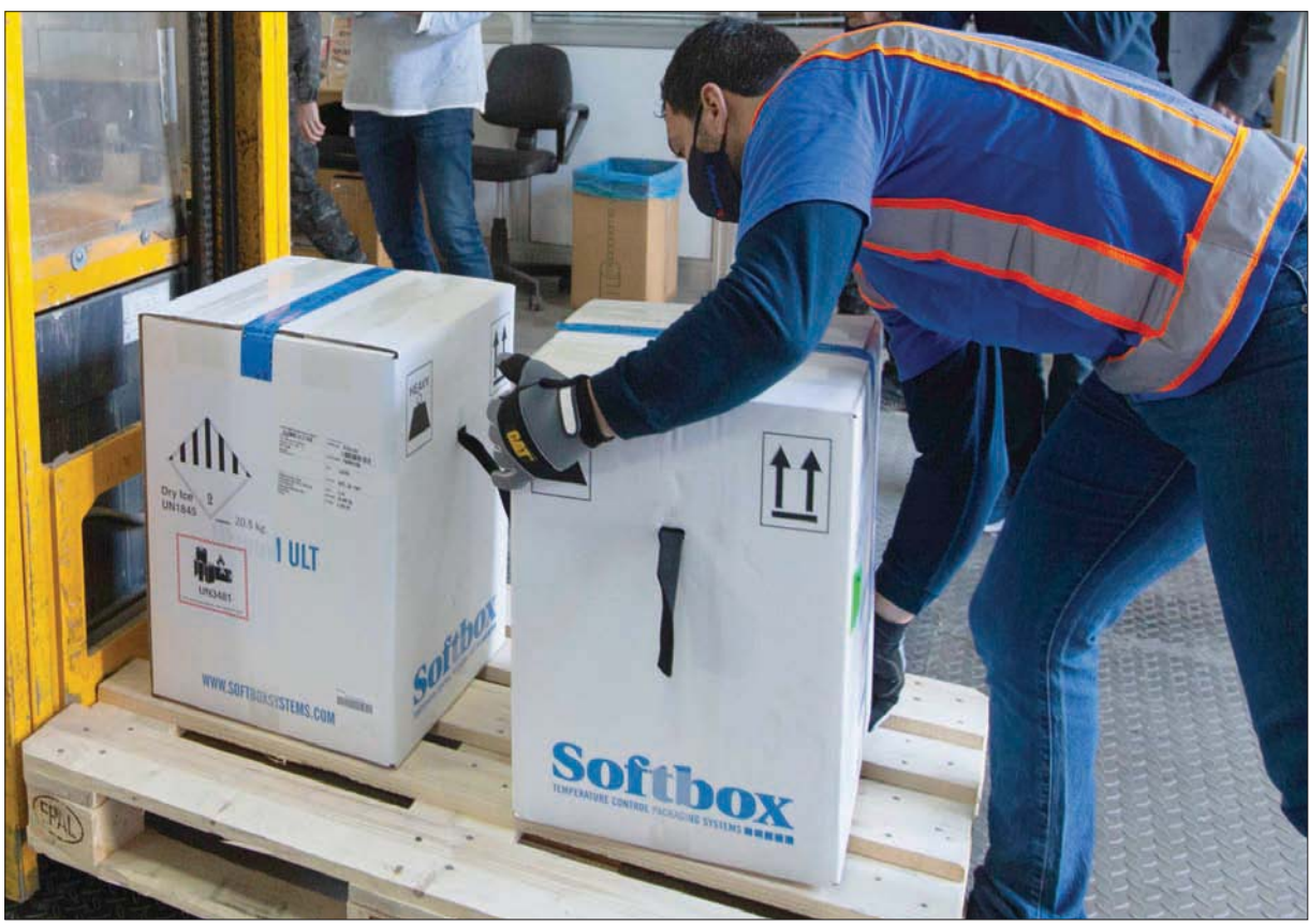
عمال الصحة في قبرص يتسلمون شحنة لقاح «فايزر» أمس

وفي أنحاء العالم، دعي السكان لاحترام إرشادات التباعد الاجتماعي بينما حذت منظمة الصحة العالمية على عدم «إضاعة» ما وصفتها بـ«التضخيم المؤلمة» التي تم تقديمها لإنقاذ حياة الناس. وفي وقت يبدأ إطلاق اللقاحات في أنحاء العالم، حذر مدير عام منظمة الصحة العالمية تيدروس أدهانوم غيبريسوس الجمعة عن أن اللقاحات توفر مخرجا للعالم من هذه المأساة. لكن تطعيم العالم بأسره سيستغرق وقتا.