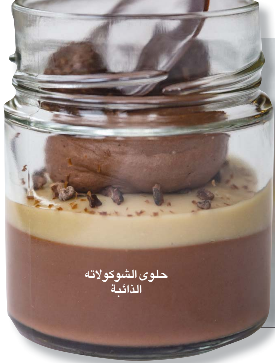
حلولى الشوكولاته الذائبة