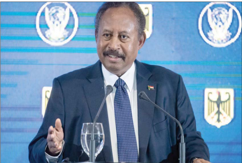
رئيس الوزراء السوداني عبد الله حمدوك

الجبهة الثورية خلال الاجتماعات في اتجاه زيادة عدد مقاعدها في مجلس الوزراء إلى أكثر من النسيبة المتفق عليها في اتفاقية السلام، بحجة أن الحكومة سيتم حلها وإعادة تشكيلها من جديد.