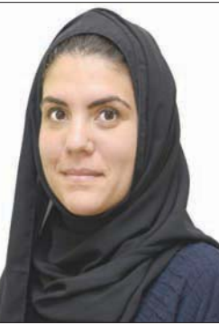
ميادة بدر الرئيسة التنفيذية لهيئة فنون الطهي