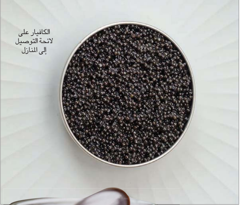
الكافيار على لائحة التوصيل إلى المنازل