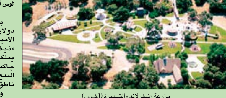
مزرعة «نيفرلاند» الشهيرة

الأعمال المقيم في ولاية مونتانا لوكالة الصحافة الفرنسية، إن رون بوركل الذي يستثمر في قطاعات مختلفة تشمل المتاجر الكبرى وصناعة الموسيقى، استحوذ على المزرعة نظراً إلى «الفرصة المصرفية العقارية» التي يقدمها. وقد عمل بوركل مستشاراً مالياً لمايكل جاكسون؛ إذ ساعده خصوصاً على تسديد ديون طائلة تراكمت عليه بسبب نمط حياته