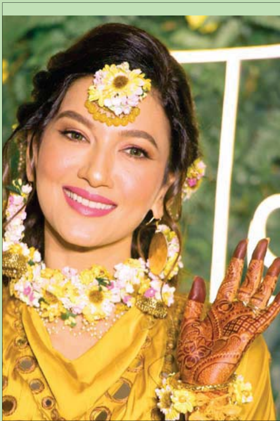
عارضة الأزياء وممثلة بوليوود جوهار خان خلال حفل هالدي «ما قبل الزفاف» في مومباي

الحيوانات الكبرى من السباع في حدائق الحيوان يجبرونها على الصوم يوماً كل أسبوع، ويؤكد المولكون بالعناية بها أن هذا الصوم يحفظ صحتها ويبرد عنها الأمراض، ويقول الدكتور (سانجرادو)، إنه «يجب على كل من تجاوز الأربعين من الناس أن يمارس هذا الصوم، وذلك لكي ينقي عن جسمه السموم المختلفة من الطعام والشراب مدة الأسبوع» انتهى. ولقد تأثرت بنصيحة ذلك الدكتور، فأتت إلى بيتي وبين نفسي: يعني الحيوانات تكون أفضل مني؟! (فشر) مستحيل. لهذا قررت أن أفعل مثلها، ولي الآن سنة ونصف، وأنا أصوم أربعة أيام في كل شهر، والحمد لله رب العالمين؛ لأنني أصبحت نشيطاً مثل الجنى (أطامر الجدران).