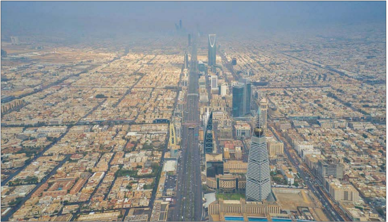
يهدف المؤتمر لتعزيز التكامل بين الجهات المختصة وذات العلاقة بالشأن العقاري في السعودية وعرض المستجدات التشريعية والتنظيمية في القطاع (واس)

أفاق ومستقبل القطاع العقاري السعودي. ويتضمن المؤتمر كلمة لمجد الحقييل وزير الإسكان السعودي، إضافة إلى كلمة أخرى لعصام المبارك محافظ الهيئة العامة للعقار، كما يناقش المشاركون في الجلسة الأولى من اليوم الأول محور حوكمة القطاع العقاري والأنظمة العقارية، ويتضمن موضوعات دور الهيئة العامة للعقار والهيئة العامة لعقارات الدولة في حوكمة القطاع العقاري وتطوره.