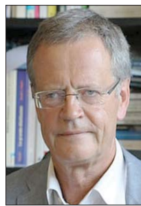
باسكال بونيفاس *

في أوروبا، يخشى مؤيدو الائتلاف الذاتي الاستراتيجي، والذي تُعتبر فرنسا أبرز