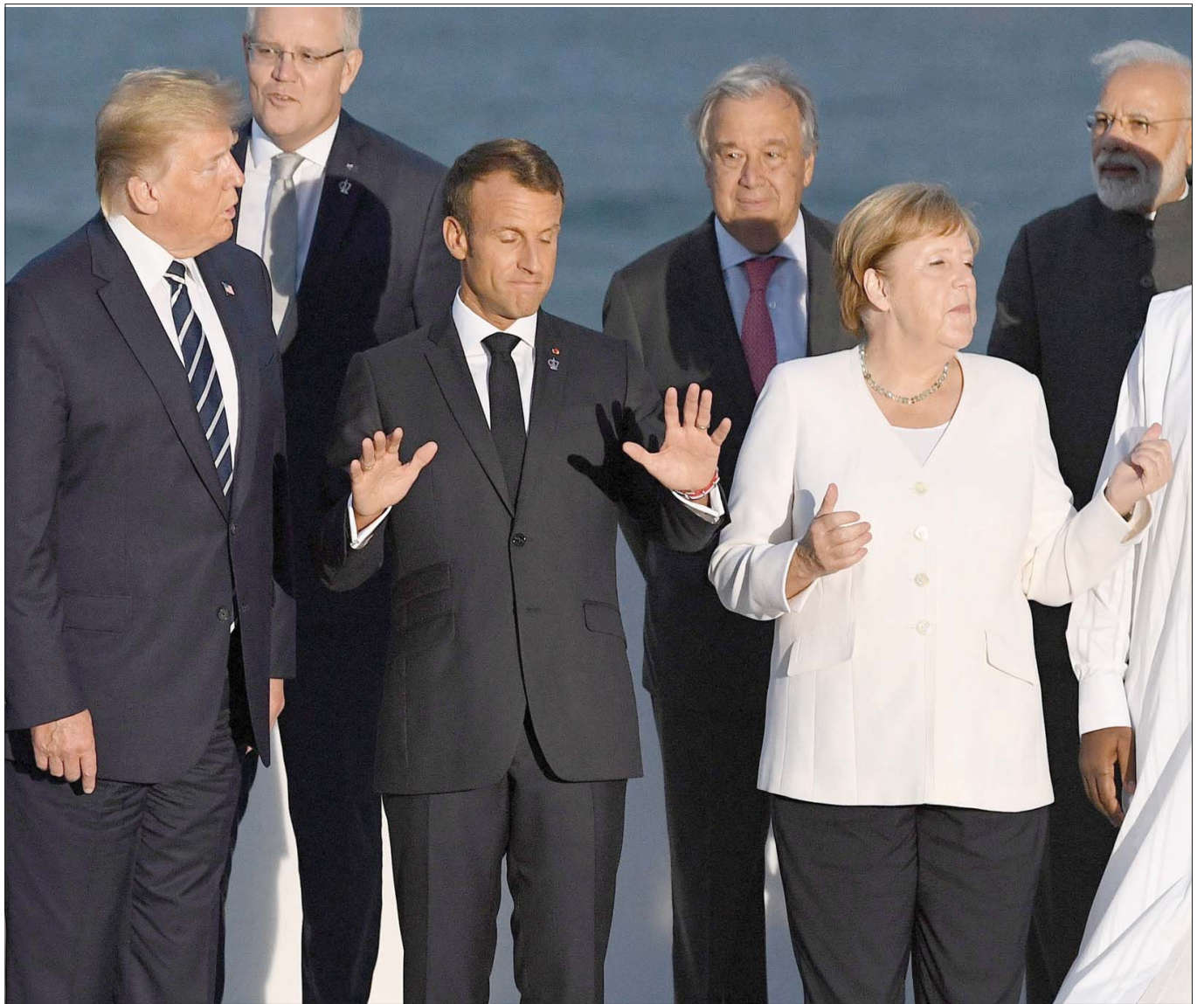
الرئيس الأميركي دونالد ترمب والفرنسي مانويل ماكرون والمستشارة الألمانية أنغيلا ميركل في قمة «مجموعة السبع» بفرنسا أغسطس 2019