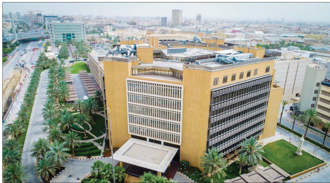
المركز الوطني لإدارة الدين أعلن الانتهاء من استقبال الطلبات على إصداره المحلي لشهر ديسمبر وأنه لن يتم تخصيص أي من هذه الطلبات نظراً لإكمال التمويل لهذا العام (الشرق الأوسط)

الرياض، «الشرق الأوسط» أعلن المركز الوطني لإدارة الدين في السعودية عن احتمال خطة التمويل للعام الجاري والبالغ حجمها 220 مليار ريال (58,6 مليار دولار) بنجاح، مشيراً إلى أنه تم تنويع مصادر التمويل عن طريق إصدارات حكومة المملكة المحلية والدولية، واستحداث قنوات تمويل جديدة. وقال المركز، أمس، إن قنوات التمويل الجديدة تشمل «التمويل الحكومي البديل، وتمويل سلسلة الإمدادات، وطروحات خاصة، بالإضافة إلى مشروع توحيد الإصدارات الحكومية المحلية». كما أعلن المركز الوطني لإدارة الدين - وحسب التقويم السنوي للإصدارات - عن الانتهاء من استقبال طلبات المستثمرين على إصداره المحلي لشهر ديسمبر (كانون الأول) الجاري تحت برنامج صكوك حكومة المملكة العربية