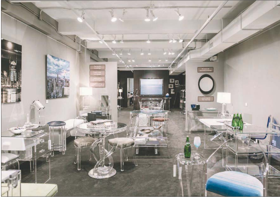
أثاث راقٍ بصالة عرض «بليكسي كرافت» في وسط مانهاتن قبل الجائحة