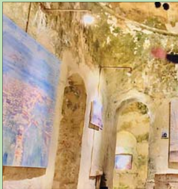
الرسام البريطاني توم يونغ وسط رسوماته المعروضة في صيدا

كان «الحمام الجديد» يفتح أبوابه يومياً للنساء في أوقات قبل الظهر وللرجال ما بعده. تسعيرة الدخول إليه لا تتعدى بضعة قروش. وكان يشهد نشاطات اجتماعية عديدة وبينها