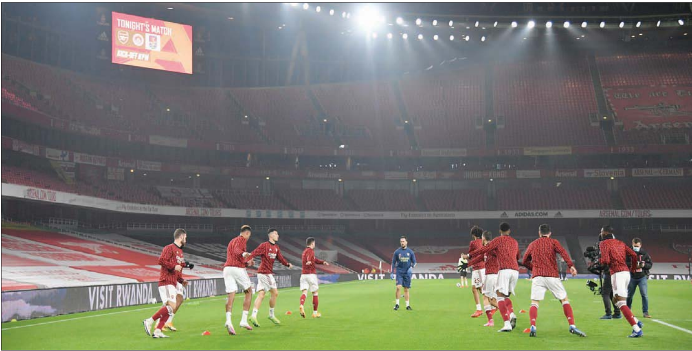
لاعبو آرسنال خلال التدريب حيث تنتظرهم مواجهة ديربي فاصلة في مستقبل مديريهم

ويلعب غداً أيضاً بيرنلي مع ليدز يونايتد، وستهام مع برايتون، وتوتنهام مع وولفرهامبتون.