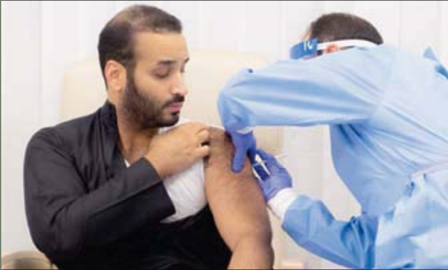
الأمير محمد بن سلمان يتلقى التطعيم أمس (واس)

والمقيم، وتوجيهاته الدائمة بتقديم أفضل الخدمات لهم.