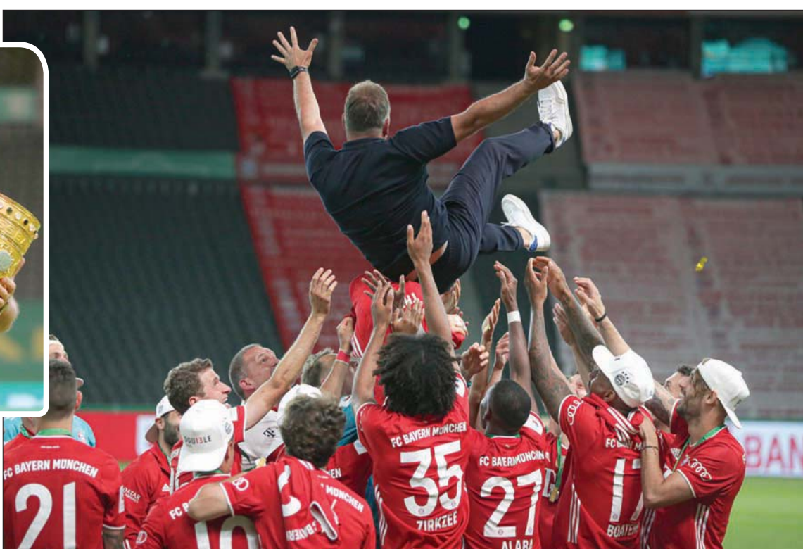
فيلك محمولاً من لاعبي البايرن بعد الفوز بدوري الأبطال ليكمل الثلاثية (أ.ب)

وأشاد فيليك بلاعبيه، قائلاً: «تطوروا بشكل لافت، ولهذا حصصنا ثلاثة القاب، الأمر دائماً يتعلق بالفريق». وتحدث كيميشت عن السرس في نجاح بايرن بموسم (2020-2019)، قائلاً: «الجانب الإنساني باتي في المقام الأول بالنسبة له (فيلك)؛ نحن لسنا مجرد لاعبين يستخدمهم داخل النظام، لكنه ينظر إلى الجانب