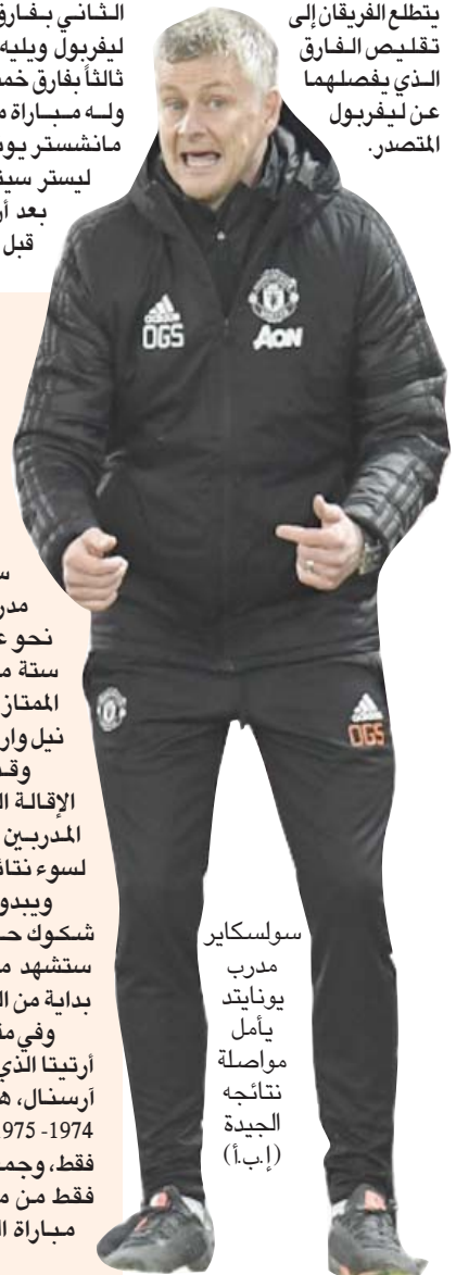
سولسكاير مدرب يونايتد يأمل مواصلة نتائجه الجيدة

تقليص الفارق الذي يفصلهما عن ليفربول المتصدر.