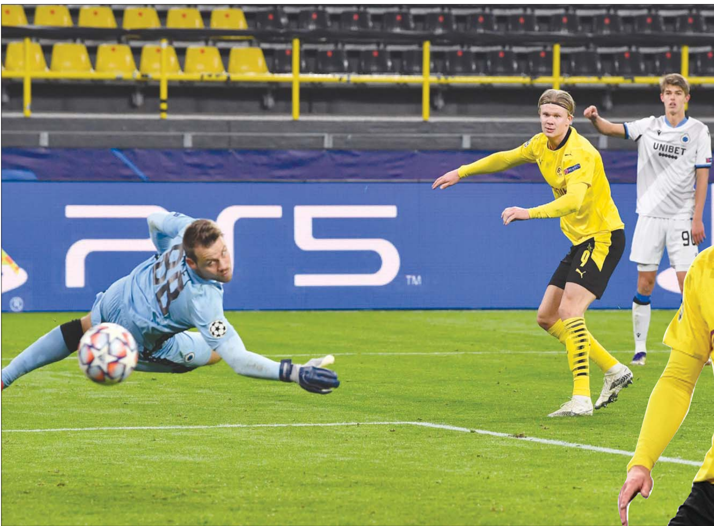
هالاند أصبح هداف دورتموند الأول والفريق دونه بلا إثياب

لقد كان مانشستر سيتي يسعى خلال الصيف الماضي للتعاقد مع النجم الأرجنتيني ليونيل ميسي بعد تدهور علاقته بمسؤولي برشلونة، لكنني أرى أن مانشستر سيتي بحاجة إلى التعاقد مع هالاند أكثر من ميسي، نظراً لأن الساحر الأرجنتيني يقترب من نهاية مسيرته الكروية، حين أن هالاند ما زال ينتظره مستقبل مشرق للغاية. كما أن اللاعب النرويجي الشاب يمكنه تقديم إضافة كبيرة للفريق من خلال قوته الهجومية ولياقته البدنية الهائلة وذكائه الخطي والتكتيكي.