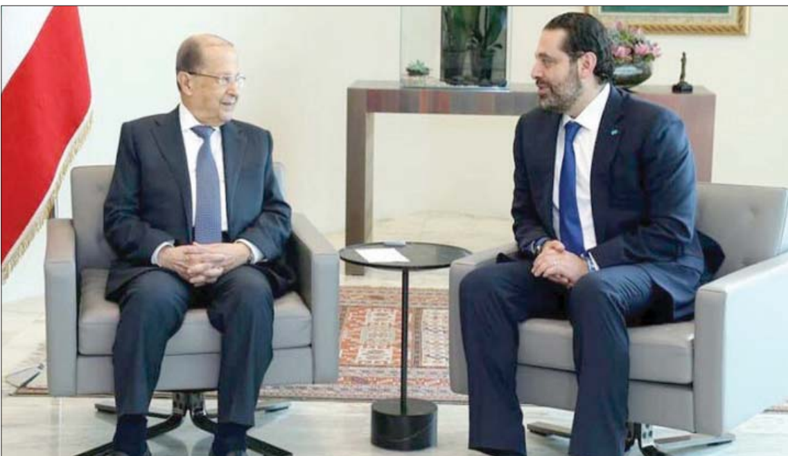
عون والحريري عقدا 14 اجتماعاً

ونقل المصدر عن جهات مقربة من رؤساء الحكومة السابقين، أن عون لا يزال يتصرف كما كان أثناء توليه رئاسة الحكومة