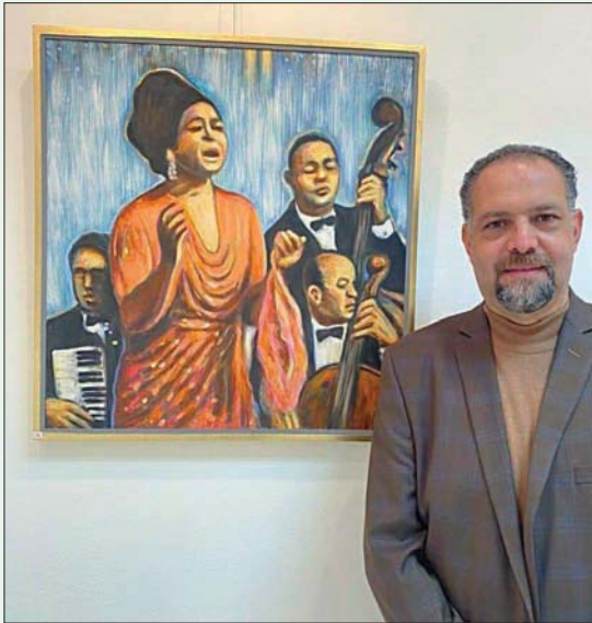
الفنان وائل حمدان في معرضه «تنويعات»