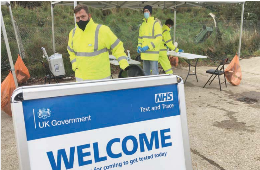
وفيات بريطانيا بـ«كوفيد - 19» تقترب من 70 ألفاً

وقال وزير الصحة البريطاني مات هانكوك يوم الأربعاء، إن السلالة الجديدة المتحورة في جنوب أفريقيا تُشكل «مصدر قلق كبيراً لأنها أكثر عدوى، ويبدو أنها تحورت أكثر من السلالة الجديدة التي كانت اكتُشفت في المملكة المتحدة». معلناً عن قيود السفر بين البلدين. وقال مخيزي في بيانه إن هذه التصريحات «ربما تكون قد أوجت بأن السلالة الجنوب أفريقية كانت عاملاً رئيسياً في الموجة الثانية التي شهدتها المملكة المتحدة، لكن الأمر ليس كذلك». وتظهر أدلة البحث أن الطفرة البريطانية نشأت قبل تلك التي اكتشفت في جنوب أفريقيا، وفق الوزير. وأشار الوزير إلى أن البريطانيين عندما أبلغوا منظمة الصحة العالمية عن وجود السلالة الجديدة في بلادهم منتصف سبتمبر (أيلول)، كانوا قد رصدوا ظهوره في مقاطعة كينت في 20 من ذلك الشهر (أقبل شهر من ظهور السلالة الجنوب أفريقية). وأعرب الوزير عن أسفه لقرار حظر السفر بين المملكة المتحدة وبلادها، مؤكداً أنه «لا يوجد دليل على أن السلالة