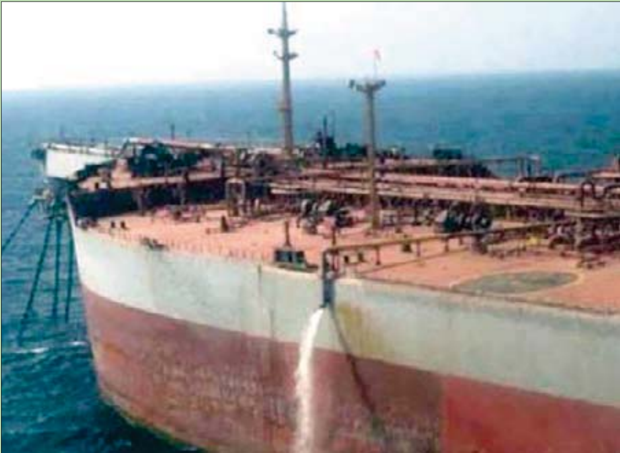
صورة متداوله في وسائل التواصل الاجتماعي لناقلة صافر

لوحت الجماعة الحوثية بالتوصل مجدداً من اتفاقها مع الأمم المتحدة بوصول فريق فني إلى ناقلة النفط اليمنية «صافر» المهتدة بالانفجار وتسرب أكثر من 1,1 مليون برميل من الخام المجدد إلى المياه في البحر الأحمر.