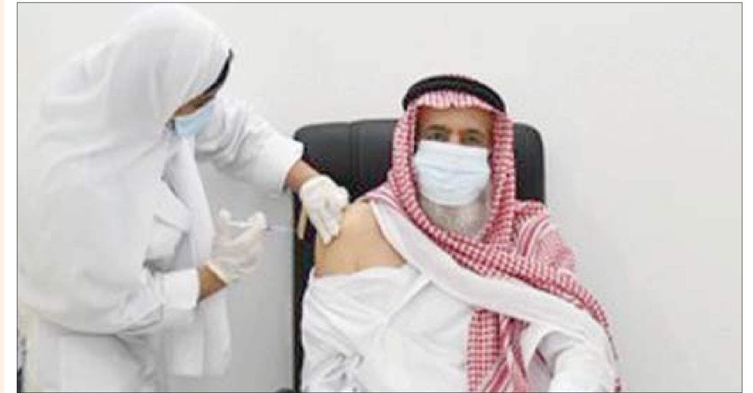
جانب من حملة التطعيم في مركز جدة

ولم يلحق لبنان بركب الدول التي أوقفت الرحلات المقبلة من بريطانيا، حيث تنتشر السلالة الجديدة من الفيروس، بل اتخذت الحكومة إجراءات أخرى بينها إجراء الفحص لجميع الوافدين من المملكة المتحدة مرتين؛ الأولى فور وصولهم إلى لبنان