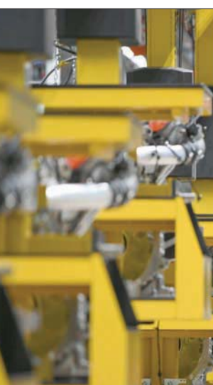
طالبات كبير نقابات عمال الصناعة الألمانية بأن تكون لها مشاركة أقوى بإعادة الهيكلة التكنولوجية