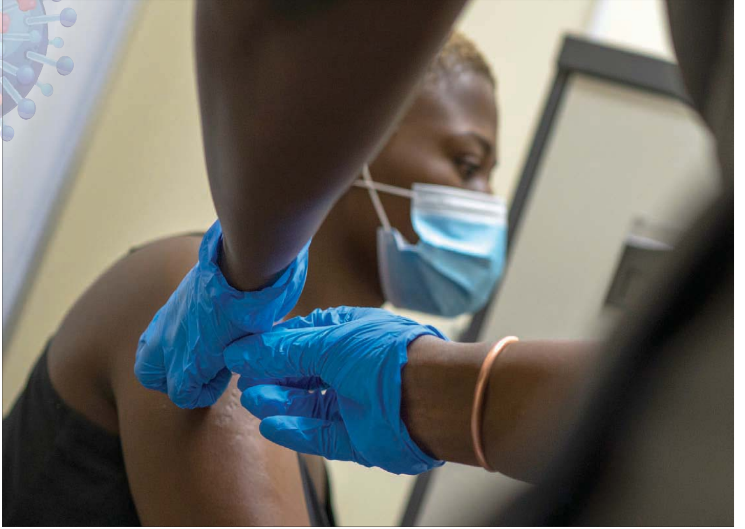
واحد فقط من بين كل 10 أشخاص داخل 70 دولة منخفضة الدخل سيحصل على اللقاح العام المقبل

الفيروسات، يمكن لجائحة «كوفيد - 19» أن تكون واحدة من جوائح عديدة سيشهدها القرن الحالي. وقد لا تكون هي الأخطر. وحيل ذلك، لا يمكن للأمم المتحدة أن تتفقد مكتوفة حيال وضع لا يتمكن فيه من الحصول على اللقاح أو العلاج إلا الدول الأغني أو الأشخاص الأغني، ليس فقط لأسباب أخلاقية ولكن أيضاً من أجل ما يسميه غوتيريش «المصلحة الذاتية الأساسية» المتمثلة بأنه «لن يكون أي منا آمناً حتى نكون جميعاً أمنين». وهو ليس الوحيد الذي يصرخ في هذه البرية. يعتقد وكيل الأمين العام للأمم المتحدة للشؤون الإنسانية والمعونة الطارئة مارك لوكوك أن الفيروس القاتل وضع قدرات المنظمة الدولية أمام «اختبار لا نظير له» منذ أكثر من 50 عاماً، في أوج الحرب الباردة، مشيراً إلى «الأثر المدمر المحتمل» للوباء على الموارد الخاصة بالمساعدات الإنسانية التي يشرف عليها في مناطق النزاعات أو المتأثرة بالكوارث الطبيعية وغيرها، مما دفع المدير التنفيذي لبرنامج الأغذية العالمي بديفيد بيزلي إلى الخشية من أن يؤدي فيروس «كورونا» إلى «جائحة جوع» صارت بالفعل على أبواب مناطق عدة في العالم.