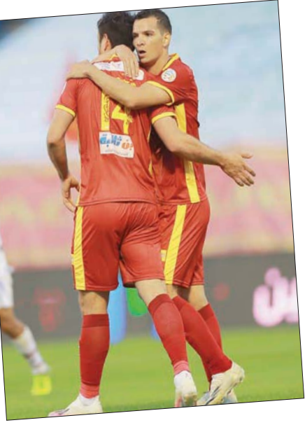
فريق ضمك غير كل أجنابه الموسم الماضي لكنه لن يقوم بنفس الفهد هذه المرة (سعد العزني)

والذي لا يقل عن «50» مليوناً، ويمكن أن يصل إلى الضعف في حال الالتزام بتطبيق خطط الحوكمة وتحقيق الإستراتيجية التي اعتمدها الوزارة والتي تهدف إلى توسيع اهتمامات الأندية باللاعبين الرياضيين والتنظيم الإداري والمالي على أساس عمل مؤسساتي لا يرتبط ارتباطاً مباشراً برحيل إدارة وقدمو أخرى. وعلى الرغم من أن أندية دوري المحترفين عهد عنها التغيير المستر للمدربين في فرقها الكروية الأولى عند حصول أي إخفاقات في فرقها الكروية الأولى فإنه مع انقضاء الجولة التاسعة لم تقم إدارة أي نادٍ بإلغاء عقد مدرب فرقه رغم تراجع النتائج والمستويات في أندية مثل النصر والشباب وحتى الوحدة والأهلي.