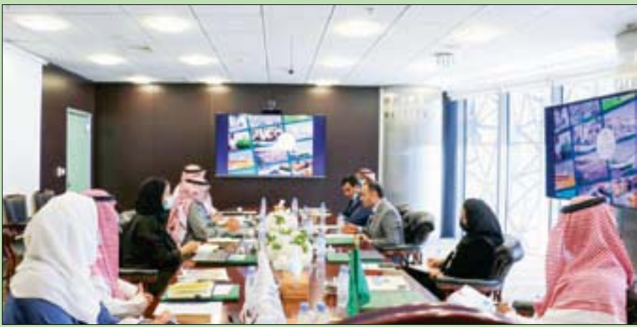
جانب من ورشة العمل التي عقدها البرنامج السعودي لإعمار اليمن في الرياض أمس

ويتبنى البرنامج أفضل ممارسات التنمية والإعمار والريادة الفكرية بمجال التنمية المستدامة في اليمن، تعزيزاً للعلاقة التاريخية والثقافية والاقتصادية التي تربط بين المملكة العربية السعودية والجمهورية اليمنية.