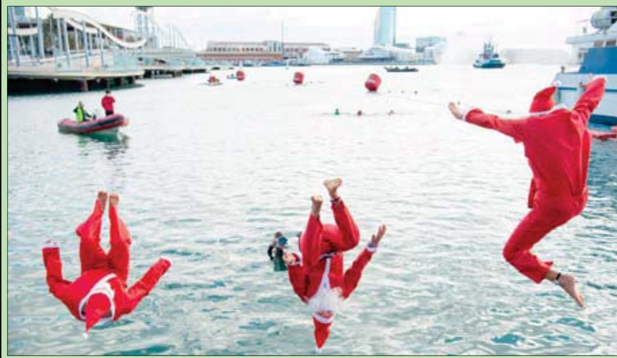
مشاركون يرتدون أزياء سانتا كلوز (بابا نويل) يقفزون في الماء خلال النسخة 111 من سباق السباحة (كأس عيد الميلاد) في برشلونة في بورت فيل أمس. يذكر أن سباق السباحة التقليدي لعيد الميلاد بطول 200 متر جمع نحو 300 مشارك. وكان قد احتفل مئات الملايين حول العالم أمس (الجمعة) بأعياد الميلاد في ظل القيود التي فرضها الجائحة عبر نسخة مختصرة من العطلة التي لطالما طبعها السفر والتجمعات الكبيرة (أ.غ.ب)

مكسيكو - لندن: «الشرق الأوسط» يمكن رؤية المغارة إلا من مسافة بعيدة بسبب التدابير الوقائية المفروضة لمكافحة الجائحة. وقال الفريديو توفار الذي يمثل عائلة أونتيغويروس، لوكالة الصحافة الفرنسية: «هذا العام، «كوفيد - 19»، أقيمت مغارة ميلادية ضخمة في مكسيكو تظهر مجسمات الملوك المجوس بوجوده مغطاة بكمامات. حملة تلقح ضد «كوفيد - 19». غداة وصول دفعة أولى مكونة من ثلاثة آلاف جرعة من لقاح «فايزر-بايونتيك» مصدرها بلجيكا. وستنضم الدفعة المقبلة 50 ألف جرعة، ليصل العدد الإجمالي إلى 1,4 مليون جرعة بحلول 31 يناير (كانون الثاني) في هذا البلد الذي يضم 129 مليون نسمة والذي تقلد منذ 93 عاماً: «الزيم منزلك، نحن معك». لكن لا