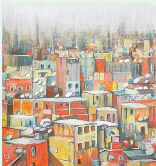
تناول المدينة من أعلى