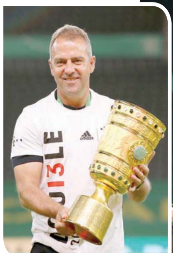
فيلك يحتفل بكأس ألمانيا

لقد أعاد فيليك كتابة تاريخ البايرن من خلال ثلاثية عام 2020، خاصة مع التحول الرائع في مسيرته بالبوندسليغا. إضافة لفوز الفريق في جميع المباريات الـ11 التي خاضها بدوري الأبطال الأوروبي. وبعدما أحكم ريال مدريد الإسباني قبضته على دوري الأبطال الأوروبي لثلاثة مواسم متتالية من 2016 إلى 2018، يبدو السؤال الذي يراود كثيرين حالياً هو: ما مدى قدرة بايرن ميونيخ الألماني على تكرار هذا في السنوات القليلة المقبلة؟