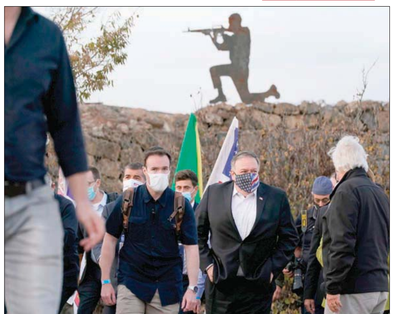
زار وزير الخارجية الأميركي مايك بومبيو في 19 نوفمبر (تشرين الثاني) 2020 مستوطنة «بساغوت» قرب رام الله في الضفة الغربية المحتلة، ليكون بذلك أول وزير خارجية أميركي يزور مستوطنة إسرائيلية. وقد توقف في «بساغوت» قبل انتقاله لزيارة مرتفعات الجولان السورية المحتلة، وقال بومبيو إن الولايات المتحدة ستصنّف الصادرات من مستوطنات الضفة الغربية على أنها «صناعة إسرائيلية». وفي الصورة الوزير الأميركي في جبل بنتال قرب جبل الشيخ حرمون في الجولان.