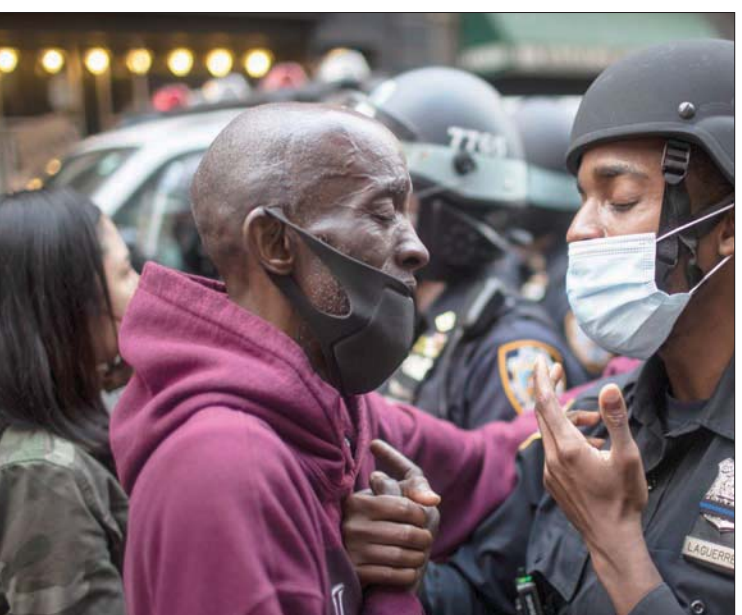
شهدت الولايات المتحدة في صيف 2020 سلسلة احتجاجات واسعة بعدما أظهر تسجيل مصور الأميركي الأسود جورج فلويد مقيداً ووجهه على الأرض ولا يقوى على التنفس، بينما يجتو ضابط شرطة أبيض بركبته على رقبة. وخرجت مظاهرات في عدد من المدن الكبرى منها نيويورك وأتلانتا وفلادلفيا وشيكاغو ولوس أنجلوس وسان فرانسيسكو وبوسطن وميامي إضافة لاحتجاجات شهدتها تجمعات سكانية ريفية في أنحاء البلاد. وفي الصورة مواجهة بين شرطي واحد المحتجين في نيويورك يوم 2 يونيو (حزيران)