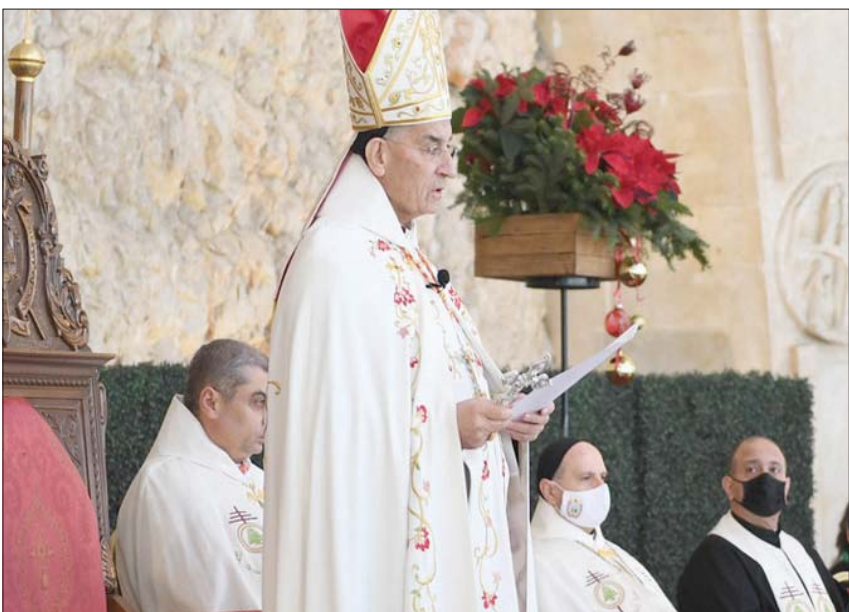
البطريرك الراعي مترسلاً قداس الميلاد

وبغياب رئيس الجمهورية ميشال عون للمرة الأولى عن قداس الميلاد، بسبب الظروف الصحية الراهنة، ونداءات جاثمة «كورونا»، قال البطريرك الراعي: «إننا توقعنا أن تعزز مكافحة الفساد وهدمنا الوطني، فتفاجأنا بها تهز هذه الوحدة، وتعيد البلاد إلى مراحل سابقة طويناها». وأضاف: «توقعنا أن