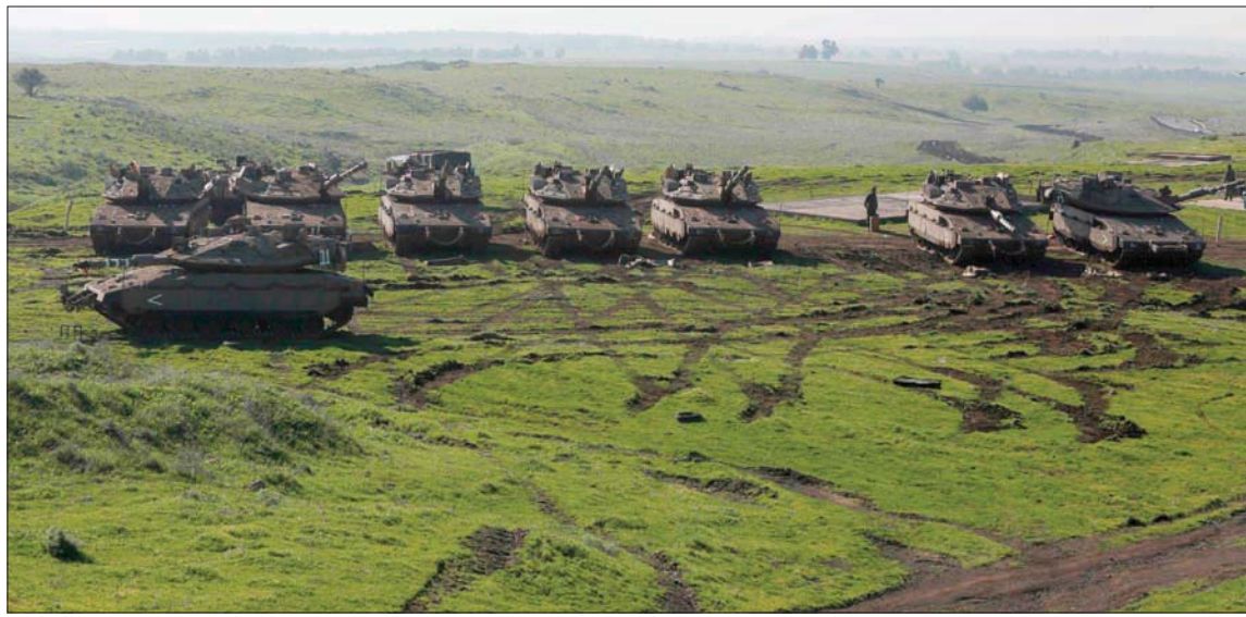
دبابات إسرائيلية في الجولان السوري المحتل أمس

صواريخ عالية الدقة في سورية ولبنان وفي أي مكان آخر».