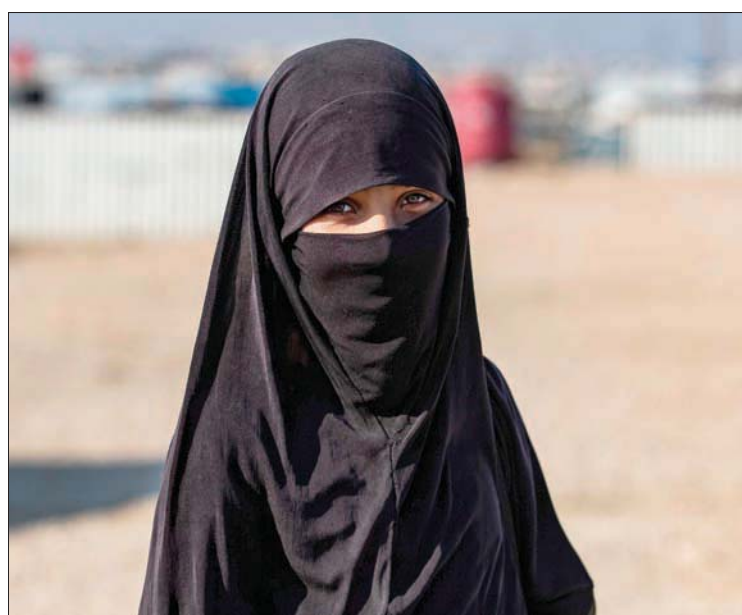
استمرت خلال عام 2020 أزمة مخيم «الهل» في الحسكة بشمال شرقي سوريا حيث تؤول هذه المخيم ما يقرب من 65 ألف شخص، من بينهم نحو 28 ألف سوري و30 ألف عراقي و10 آلاف أجنبي من جنسيات عديدة، وفق تقديرات الأمم المتحدة. وفي الصورة سورية يُعتقد أنها قريبة لعناصر من تنظيم «داعش» خلال الإفراج عنها للاتحاق بأهلها يوم 21 ديسمبر (كانون الأول).