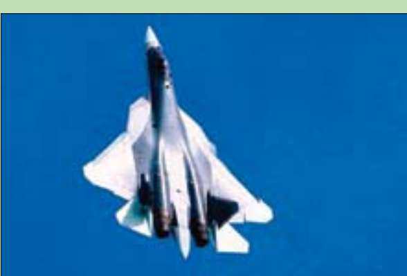
إحدى مقاتلات «سوخوي 57» التي أعلنت روسيا أمس بدء تزويد جيشها بها

أقرب أفراد عائلته لم يتمكنوا من زيارته خلال العام الأخير. وهو لا يواجه فقط أعراض المرض وظروف العزلة الإجبارية بسبب تفشي الوباء، لكنه يتابع أيضاً «المراجعات» التاريخية لأدائه السياسي، على خلفية عودة سحب «حرب باردة» جديدة وسباق تسلح وتحالفات تعيد تقسيم أوروبا والعالم. ومن المصادفات أن تقوم روسيا بإعلان، أمس، عن البدء بتسليم الجيش الروسي أحدث طرازات المقاتلات من الجيل الخامس «سوخوي 57» في إطار برنامج لتحديث تسليح الجيش الروسي. وتعد «سوخوي 57» المنافس الروسي للمقاتلة الأميركية «إف 35»، وتمت تجربة المقاتلة في سوريا، وخضعت بعد ذلك لتحسينات في تسليحها بناء على «التجربة الميدانية المباشرة».