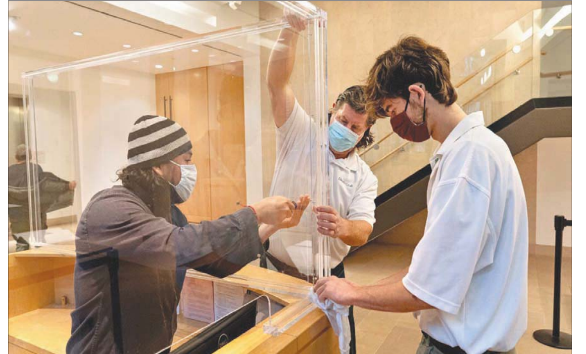
تركيب حاجز وقائي بالمتحف الأوكراني في «القرية الشرقية» بمانهاتن