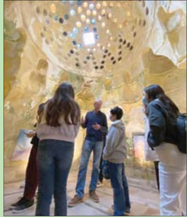
معرض «إحياء» يتضمن 70 لوحة زيتية تحكي عراقة صيدا