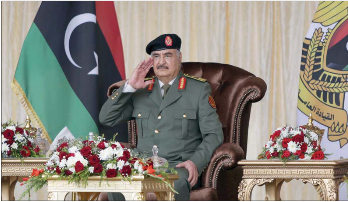
خليفة حفتر خلال احتفال أقيم وسط بنغازي بمناسبة الذكرى الـ69 لعيد الاستقلال

وكرر العقيد محمد قنوني، المتحدث باسم قوات الوفاق، الاتجاه نفسه، بقوله إنه «لن نقبل بأي سلام» مع من وصفهم بـ«المجرمين المعتدين». كما حذر اللواء أسامة جويلي، أمر غرفة الترتيب لفتح مقانلي الوفاق على نظام قاذفات الصواريخ المتعددة والمدفعية وقذائف الهاون والأسلحة الثقيلة. وأجبت حكومة الوفاق، مساء أول من أمس، بحضور السفير التركي سرحات أكسن، الذكرى الـ69 لاستقلال ليبيا بتخليم عروض عسكرية وسط العاصمة طرابلس، في ظل انتشار أمّني واسع، حيث أعلن السراج عن مناطق إيوافق، وعدم السماح العليا للانتخابات، واستعداد حكومته لتسخير الإمكانيات كافة والتشريعات الضرورية لتأمين الغفوية من إنجاز الانتخابات التشريعية والرئاسية قبل نهاية العام المقبل.