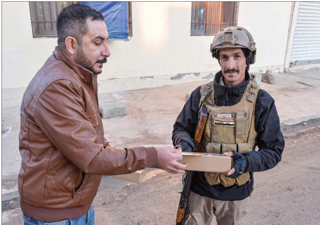
متطوع يقدم هدية لعنصر أمن في بلدة قرقوش المسيحية في شمال العراق أمس

بلا ترميم للبيت الشيعي، طبقاً للدعوة التي كان أطلقها زعيم التيار الصدري مقتدى الصدر، فأجأ «تحالف الفتح» بزعامة هادي العامري، القوى الشيعية، بدخوله الانتخابات بتشكيلته نفسها التي دخل بها انتخابات عام 2018، زائداً المجلس الأعلى بزعامة همام حمودي. وفيما كان زعيم «تيار الحكمة» عمار الحكيم، دعا إلى بناء تحالف عابر للمكونات، فإن «تحالف الفتح» حسم الجدل بشأن كلا الدعوتين: دعوة الصدر الخاصة بالبيت الشيعي، ودعوة الحكيم الخاصة بالبيت العراقي. كان القيادي في «تحالف الفتح» والنائب في البرلمان عن «كتلة الصادقون» البرلمانية نعيم العبودي، أعلن في تغريدة على «تويتر»، أن «المكتب الانتخابي للتحالف أعلن رسمياً عن قرار خوضه الانتخابات المقبلة بمكوناته السابقة، وضمن قائمة موحدة»، مبيناً في الوقت نفسه أن هذه الخطوة تعبر عما سماه «المنافسة الشريفة سعياً لبناء العراق».