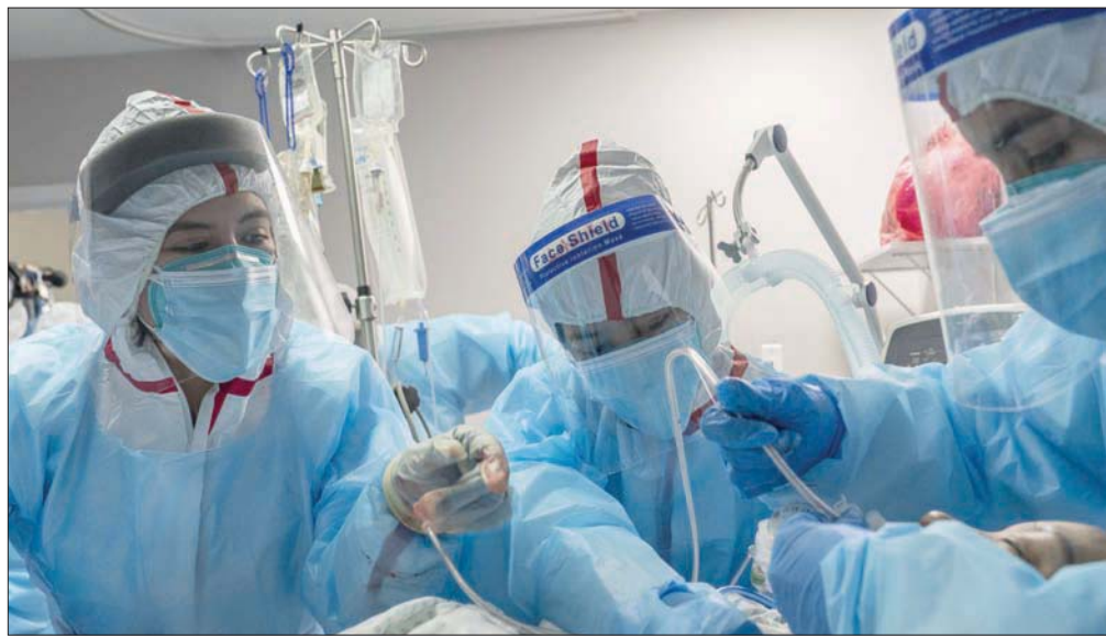
طاقم طبي يحاول إنقاذ مريض «كورونا» في أحد مستشفيات تكساس