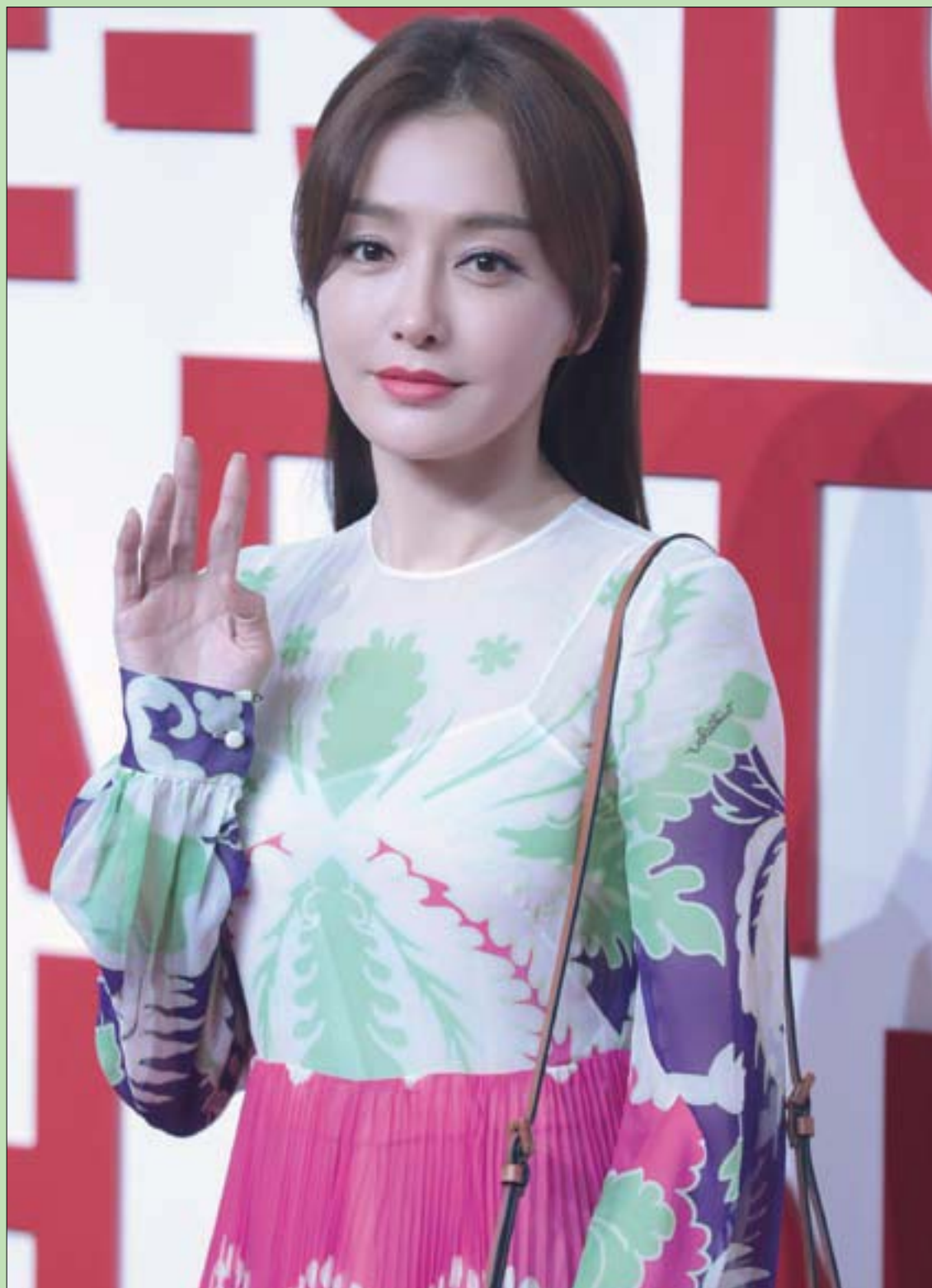
المثلة الصينية كين لان حضرت افتتاح معرض فالنتينو في شنغهاي

وفي المستشفى ذكر هو لمراسل الصحيفة (بكل شفافية): «إن زوجتي لا تتفاهم معي إلا بالأسلوب العنيف، وتسانني بين الحين والآخر: (من فين يوجعك)؟، وهات يا ضرب».