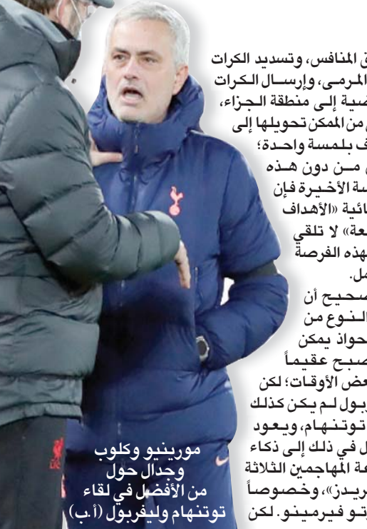
مورينيو وكلوب وجدال حول من الأفضل في لقاء توتنهام وليفربول

إن ما حدث في تلك المباراة يذكرنا بالأسباب التي تجعل عدداً قليلاً للغاية من أندية النخبة تلعب بطريقة الدفاع المتأخر، والاعتماد على الهجمات المرتدة السريعة التي يعتمد عليها مورينيو. ورغم أن الجميع ينتقدون التغيير المستمر في قوانين كرة القدم؛ لكن الشيء الوحيد الذي نجحت فيه هذه القوانين هو أنها جعلت «قتل» المباراة أكثر صعوبة مما كان عليه الأمر قبل عقد من الزمن. لكن هناك سبباً آخر وراء ذلك، وهو التفاوت المالي الهائل بين الأندية، حتى داخل بطولة الدوري نفسها، وهو الأمر الذي جعل الأندية الكبرى تواجه منافسين يعتمدون على الدفاع المتكامل كثيراً، وهو الأمر الذي منح هذه الأندية كثيراً من الخبرات في فك طلاسم هذه الدفاعات، والتغلب عليها. قد يشير مورينيو إلى أنه كان على بُعد أربع دقائق من الخروج بنتيجة التعادل التي كانت ستبقي توتنهام في صدارة جدول الترتيب؛ لكن بعد التراجع أمام كريستال بالاس يوم الأحد الماضي، فقد الفريق ثلاث نقاط أخرى بسبب أهداف اشتهرت بها شبابه في دقائق العشرة الأخيرة، بعدما كان الأمر يبدو تحت السيطرة بالنسبة لـ«السبيرز».