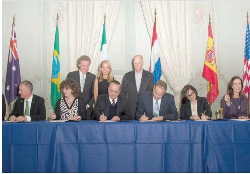
توقيع اتفاقية باريس لتغير المناخ في ديسمبر 2015

في الثاني عشر من هذا الشهر مَرَّت ذكرى خمسة أعوام على توقيع اتفاقية باريس بشأن تغيّر المناخ، وذلك خلال مؤتمر الأطراف الحادي والعشرين للاتفاقية الإطارية لتغيّر المناخ. ولقد كان ذلك ولا يزال علامة بارزة في مسيرة المجتمع الدولي نحو التصدي المجتمعي البشري في العصر الحديث، ألا وهي مخاطر تغيّر المناخ العالمي والإرتفاع المستمر لدرجة حرارة الكوكب الذي نعيش فيه. تلك المسيرة الطويلة بدأت في نهايات الثمانينات من القرن الماضي، وتُوّجت بتوقيع الاتفاقية الإطارية لتغيّر المناخ في أثناء قمة الأرض التي عُقدت في العاصمة البرازيلية