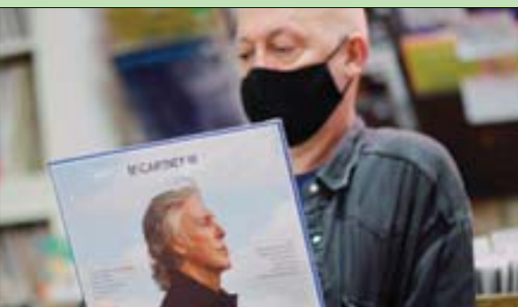
أسطوانة مآكرتني الجديدة

«سي» عن اللقاح: «سأخذ، واود أن أشجع الناس على أخذه أيضا». وأضاف: «في الماضي، كان ثمة أشخاص يعارضون اللقاحات ولا بأس في ذلك، فهذا ما اختاروه. ولكن الآن بوجود الإنترنت، باتت هذه التوجهات تترسخ وثمة أشخاص لن يأخذوا اللقاح».