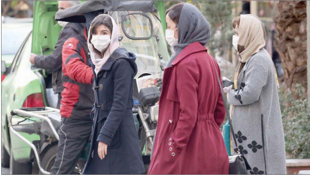
سكان طهران يعانون من تفشي الفيروس

وقالت إن إجمالي عدد الوفيات في البلاد بلغ 53448 وفاة بسبب الفيروس، في حين بلغ مجموع الإصابات مليوناً و152072 إصابة في إيران، أكثر البلدان تضرراً من الجائحة في منطقة الشرق الأوسط. وقال رئيسي إن هناك انخفاضاً بنسبة 50 في المائة في الوفيات اليومية بسبب فيروس كورونا منذ فرضت السلطات قيوداً في 21 نوفمبر (تشرين الثاني) للحد من انتشار الوباء. وأضاف أن انتشار الفيروس شهد تباطؤاً في 30 إقليماً من بين 31 إقليمياً بإيران، إلا أن إقامة التجمعات للاحتفال بـ«ليلة يلد» قد بحدت انتكاسة نتيجة هذه الجهود. وتحفل ليلة الانقلاب الشنتوي أيضاً أفغانستان وأوزبكستان وطاجيكستان وتركمانستان وأذربيجان وأرمينيا.