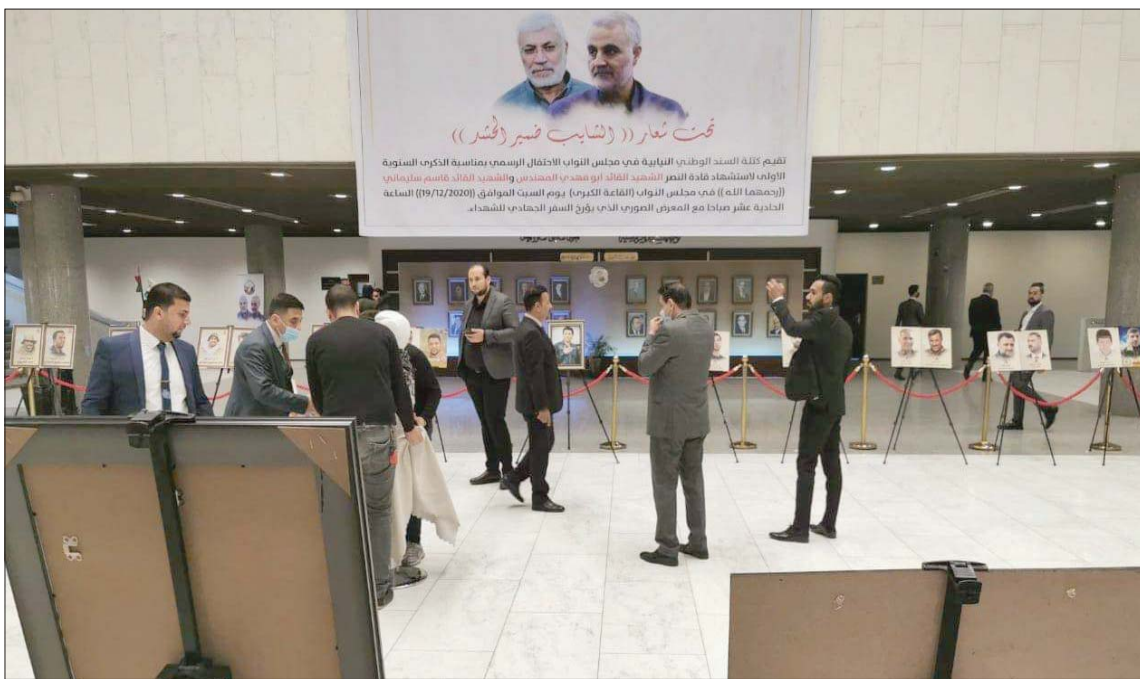
صورة نشرها إعلام الحشد الشعبي، لفعالية إحياء ذكرى سليمان والمهندس في البرلمان العراقي أمس

إحياء الذكرى يرتبطون بعلاقات عالية المستوى مع الجانب الأمريكي الذي قتل سليمان والمهندس. ورأى رئيس الجمهورية الدكتور برهم صالح، خلال كلمة القاها نيابة عنه كبير مستشاريه علي الشكري، أن «أبو مهدي المهندس وقاسم سليمان كانا مثالا لكل أحرار العالم»، فيما تحاشى رئيس الوزراء خلال الكلمة التي القاها ممثله في الاحتفال وزير الثقافة حسن ناظم، ذكر اسم سليمان. وقال: إن «الشهداء انجزوا مهمتهم الوطنية وبقي علينا أن نديم وجودهم ببنينا أسلحة موجهة ضد الذين ينفصون من الدولة وتأسيسها». وأضاف