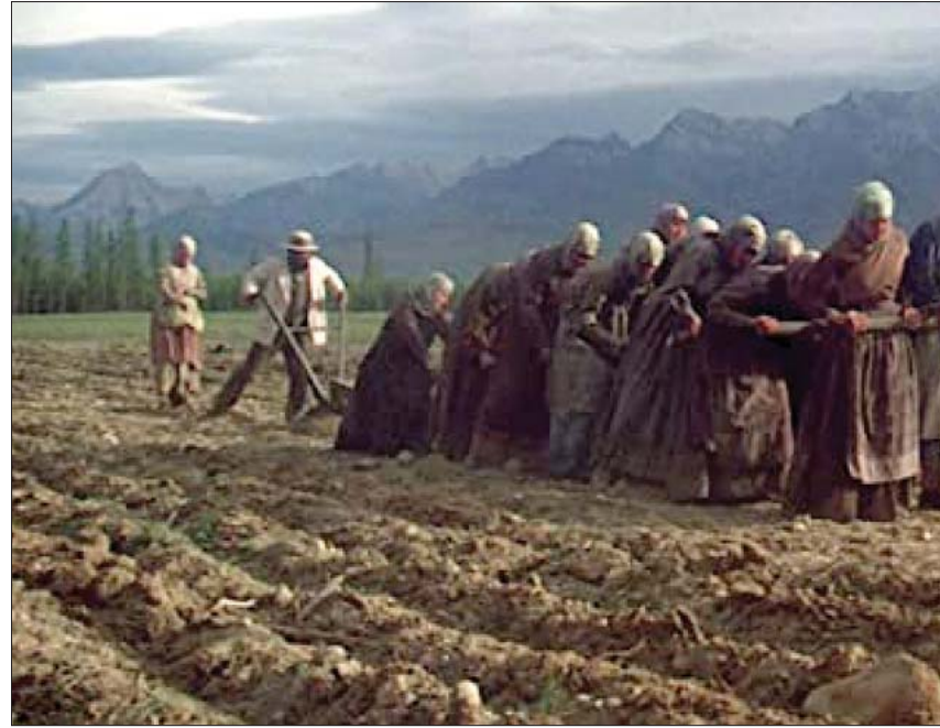
مهاجرون بولنديون في أميركا: لقطة من فيلم «بوابة الجنة»

أهم هذه الأفلام، على نحو أو آخر، فيلم مايكل شيمينو «بوابة الجنة» (Heaven's Gate) الذي أنجزه، بعد سنوات من العمل على السيناريو ومصاعب كثيرة حين التصوير، سنة 1980. في عام 1892، وقعت معارك وجود في ولاية وايومنغ بين لاجئين بولنديين وتشيكين، وبين مرتزقة استباجرهم أصحاب مزارع لتربية البقر بغية طردهم من الأراضي المحاذية لمزارعهم. سُميت تلك المعارك حرب «جونسون كاوتشي» نسبة لموقعها. وأحسن شيمينو توفير الحديث للجيئات المتعددة للموضوع، فالحكايات متعددة وأبطالها (من الفريقيين الأميركي المولد والمهاجرين) مختلفون في الثقافات والأفاهيم والأغاث. قبل ذلك اشغل المخرج فرنسيس فور كويولا، بنقل تجربة الحياة بالنسبة للمهاجرين الإيطاليين في فيلمه «العراب» (1972) و«العراب 2» (1974). هذان الفيلمان تحفان بصرف النظر عما حوياه من مواضيع، في الأول تنتقل إلى حياة عائلة دون كارلوني (مارلون