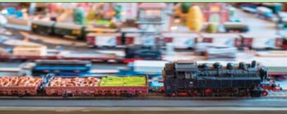
شبكة قطارات في برلين استقرت تشييدها أكثر من ثلاثة عقود

وربم البناء ارتفاعاً شديداً، وفق المصدر عينه.