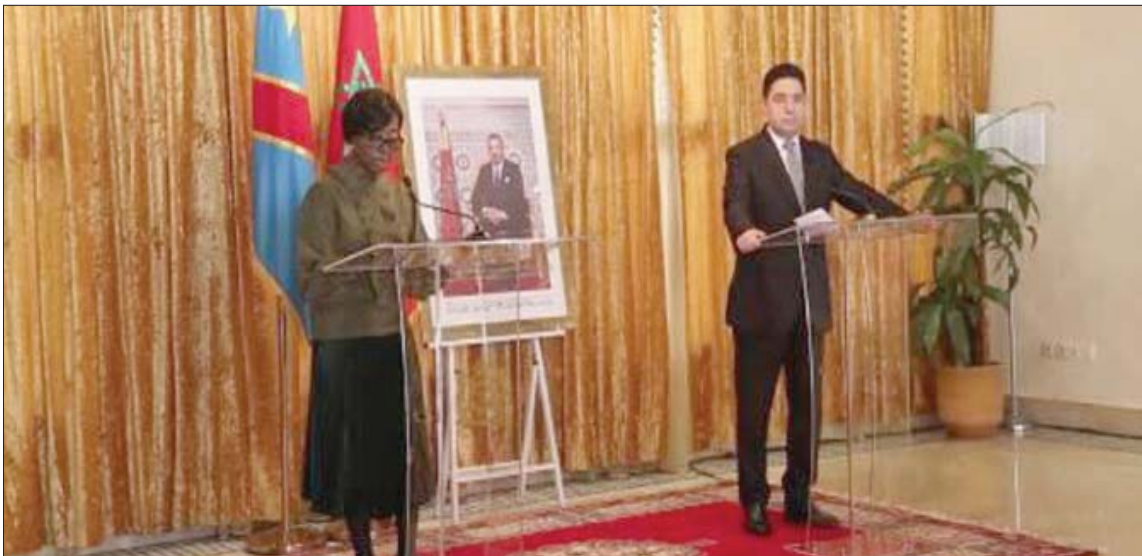
وزير الخارجية المغربي ونظيرته من جمهورية الكونغو خلال حفل افتتاح القنصلية العامة بمدينة الداخلة أمس

المشكل موروث عن حقبة أخرى، وأن أفريقيا في غنى عنه». كما أشار بوربيطة إلى أن موقف جمهورية الكونغو باتي كذلك في السياق الذي اشتغل عليه الملك محمد السادس، خلال السنوات الأخيرة لدعم مغربية الصحراء بالمواقف والاتفاقيات الدولية ويفتح القنصليات، التي بلغ عددها اليوم 19 قنصلية، علاوة على الافتتاح المستقبلي لقنصليتي الأرن والولايات المتحدة، ليلبغ على الصعيد الدولي، ما سيما بين أوروبا وإفريقيا، وهذا ما يبوؤها مكانة هامة، سترزيد من وتيرة تطور المدينة، بمعية النموذج