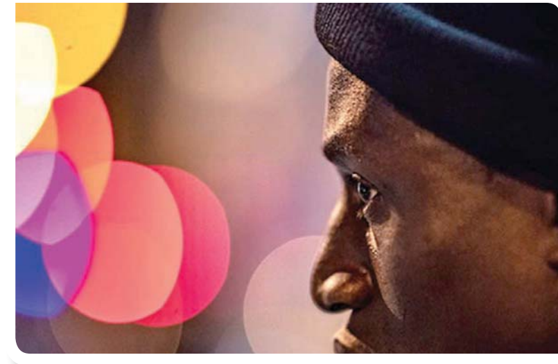
الفيلم الألماني «برلين الكسندربلاتز»

من إنتاج العام الماضي، فيلم الألماني رينر فرتر فاسبيندر، وضعها في «أميركا أميركا» (1963).