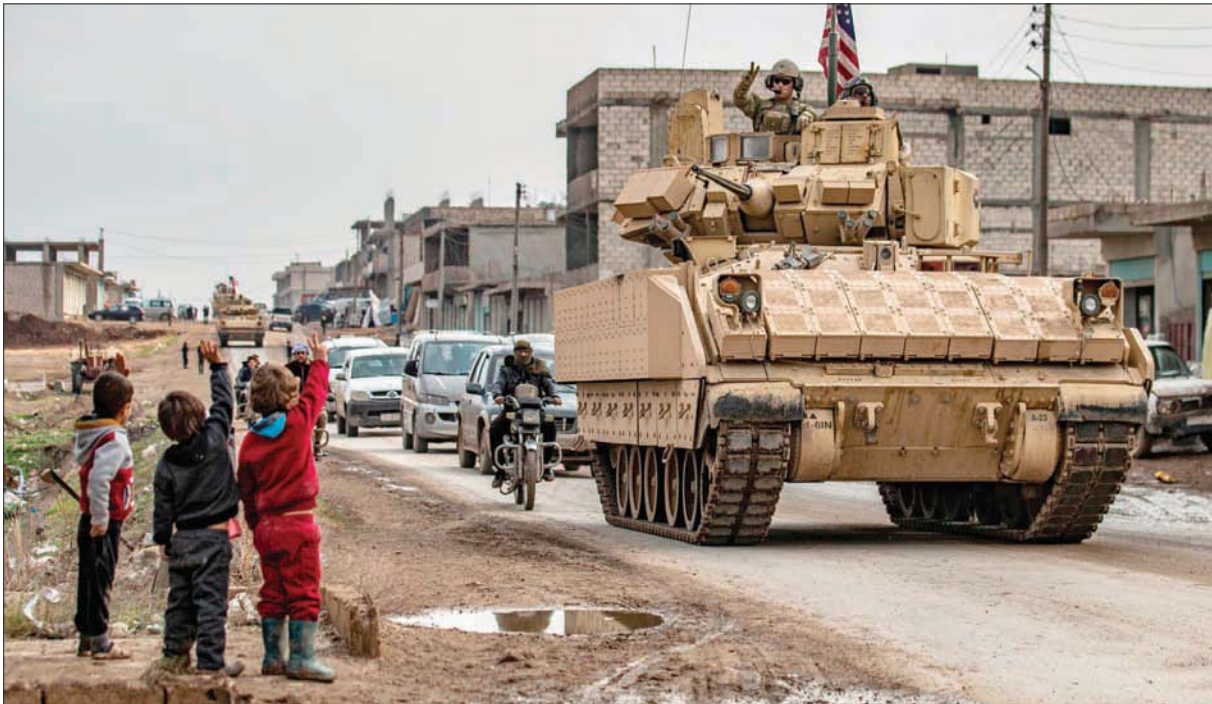
جندي أميركي على مدرعة «برادلي» في ريف الحسكة شمال شرقي سوريا أول من أمس

ترتبط التطبيع بانسحاب إسرائيل من كل الأراضي المحتلة، ولمحا في المقابل إلى أن دمشق «لن تسمح بان نواجه وضعاً جديداً نتحارب فيه كعرب وتكون إسرائيل هي المستفيد الوحيد من هذه المواجهة». وزاد أن «كل الدول العربية ستكون متضررة إذا نحت إسرائيل في الاستفراء بكل منها». وحذر إسرائيل في الوقت ذاته، من أنها «تتوهم هي من يدعمها بالقدرة على الاحتفاظ بالأراضي المحتلة، وقد تابعنا أخيراً الانتفاضات التي شهدتها الجولان ضد تركيب محطات هوائية».