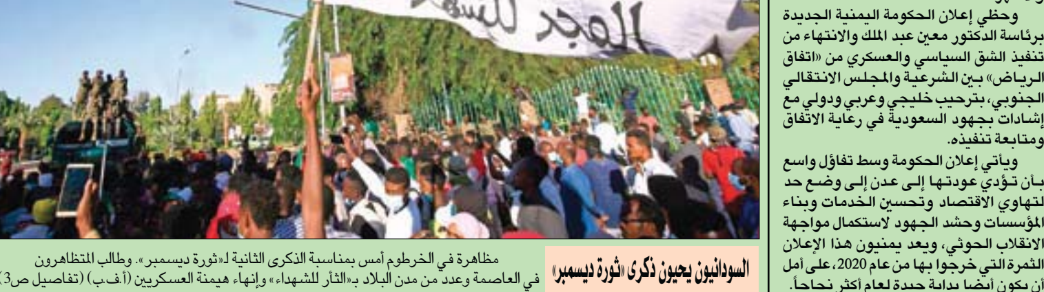
مظاهرة في الخرطوم أمس بمناسبة الذكرى الثانية له ثورة ديسمبر. وطالب المتظاهرون في العاصمة وعدد من مدن البلاد بـ«الثأر للشهداء» وإنهاء هيمنة العسكريين (أ.غ.ب) (تفاصيل ص 3)

عدن، علي ربيع جدة، أسماء الغابري أعلن السفير السعودي لدى اليمن محمد آل جابر أن الحكومة اليمنية الجديدة ستعود إلى العاصمة اليمنية المؤقتة عدن في غضون أسبوع إلى عشرة أيام بعد استكمال الترتيبات اللوجيستية. وأصبح في تصريحات نقلتها قناة «العربية» عن «متابعة مستمرة ودقيقة من الأمير خالد بن سلمان (نائب وزير الدفاع السعودي) وفريق ارتباط سياسي وعسكري على الأرض لمعالجة أي خلاف والمضي قدماً في توحيد الصفوف واستعادة الدولة لعملياتها، وهذا ما جرى وسيتم استكماله في الأيام والأسابيع القادمة». وحظي إعلان الحكومة اليمنية الجديدة برئاسة الدكتور معين عبد الملك والانتفاء من تنفيذ الشق السياسي والعسكري من «اتفاق الرياض» بين الشرعية والمجلس الانتقالي الجنوبي، بترحيب خليجي وعربي ودولي مع إشارات بجهود السعودية في رعاية الاتفاق ومتابعة تنفيذ.