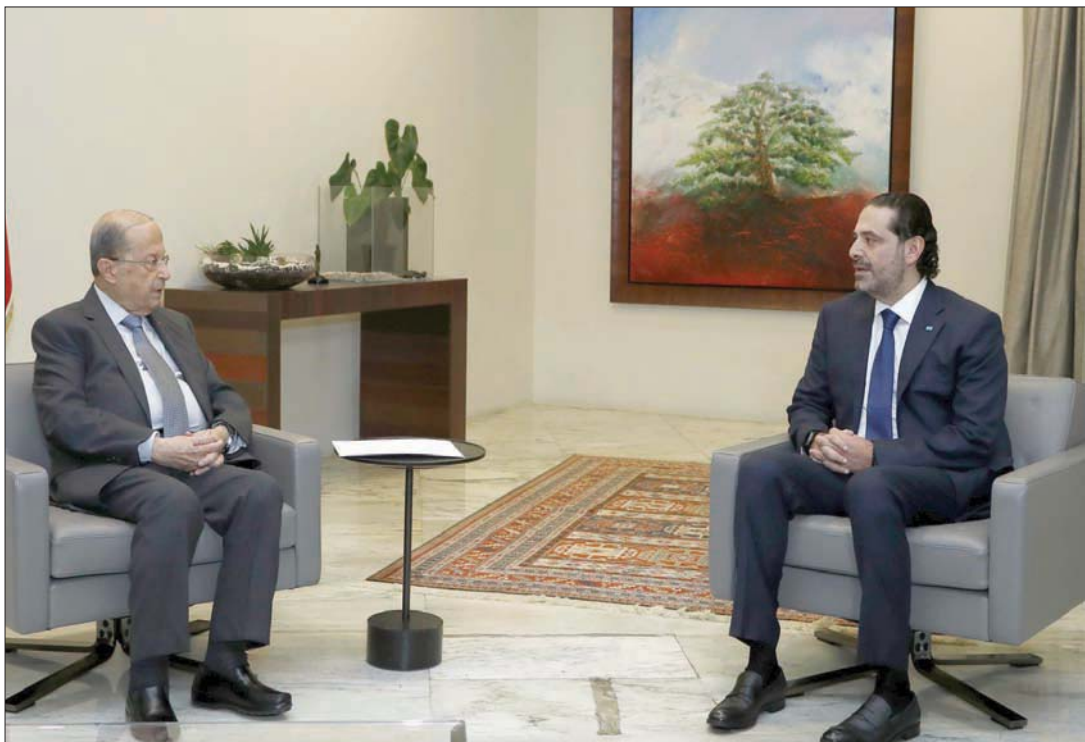
الرئيسان عون والحريري وعقبات تشكيل الحكومة

والمحاولات الجارية لمساواة الآخرين بعقوبات من نوع آخر في ملف انفجار مرفأ بيروت، من جهة أخرى، تحت عنوان «من ساوك بنفسه ما ظلمك». ناهيك عن أن مصادر مواكبة لتعثر تشكيل الحكومة باتت على قناعة بأن تأخير تشكيلها يعود لأسباب خارجية، وتحديداً إيرانية، وتعتبر أن ما جرى من اتصالات أبرزها تلك التي قام بها البطريك الماروني بشارة الراعي أدت إلى انكشاف الأطراف على حقيقتها، وتبيان من يعطل تأليفها.