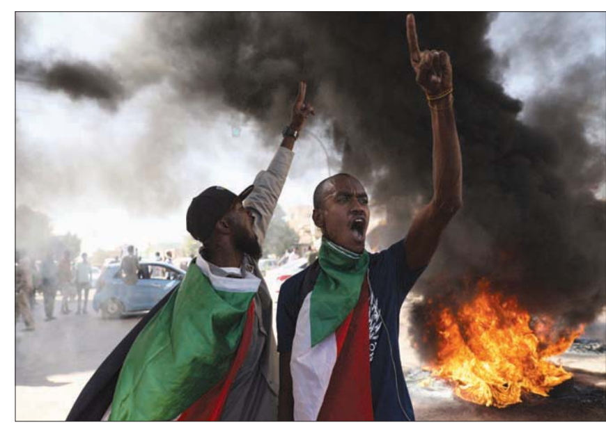
مظاهرة في أحد شوارع الخرطوم في ذكرى الثورة

وأمر النائب العامة وكلاء النيابة بمرافقة قوات الشرطة التي تؤمن الموكب، والتنسيق مع اللجان الميدانية، لمنع الأجهزة الأمنية من استخدام القوى المفرطة تحت أي ظرف من الظروف.