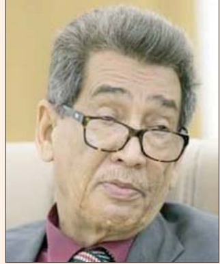
عبد السلام البدري (مكتب الإعلام بالحكومة الليبية المؤقتة)

للتقليل حجم شحنات الأسلحة التركية، التي لا تزال تصل إلى الغرب الليبي»، وفيما فيما يتعلق بالازمات المرحلة، كالوقود وتأخر صرف الرواتب، أعرب نائب رئيس الوزراء عن أملة في «انتهاؤها تدريجيا مع بداية العام المقبل». وقال احتلال ليبيا موقعا مقدما في قائمة الدول الأكثر فسادا: «إنه أمر مؤلم، لكنني أقر به وهو موجود بعموم البلاد. لكنه في الغرب أعلى بكثير من الشرق الليبي. فالأخير لا يملك بالأساس موارد ليتم نهبها، ولأسفل معدلات الفساد أخذت منحى تصاعديا خلال السنوات الأخيرة للنظام السابق، ثم تضاعفت بدرجة كبيرة في ظل الفوضى التي شهدتها البلاد منذ 2011». وبتشان تقديره لحجم الأموال الليبية التي تم توجيهاها إلى تركيا، قال البدري إن «الرقم المعلن هو 10 مليارات دولار، في شكل ودائع أو قروض من دون فوائد، ومن غير المتوقد استعادتها، فضلا عن استغلال الأصول الليبية الموجودة في تركيا. أما الرقم غير المعلن فهو كبير جدا، وتكفي الإشارة فقط ما قامت تريب بنهبه عبر رواتب المرتزقة السوريين، والتي قُدرت بما يقرب من 40 مليون دولار شهريا، إضافة إلى الفساد في دول علاج الجرحى الليبيين بالخارج».