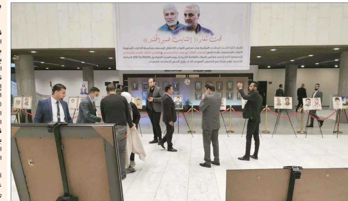
صورة نشرها إعلام الحشد الشعبي، لفعالية إحياء ذكرى سليمان والمهندس في البرلمان العراقي أمس