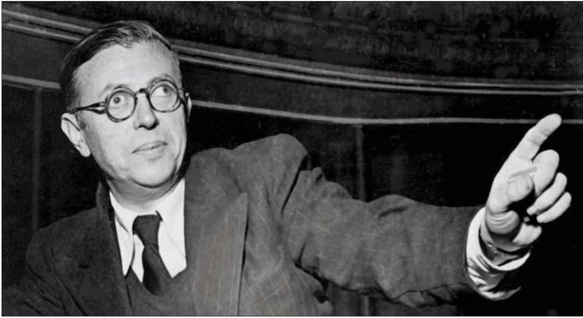
الفيلسوف الفرنسي جان بول سارتر

من الشهادات الحية عن سارتر شهادة روبير غاليليمار الذي كان يقرأ كتاباته قبل أن تنشر، أو قل كان يعطيها لقراء مختصين في بعض الأحيان. بالطبع فإن كل نص يأتي من جهة سارتر كان يحظى بالموافقة فوراً لأن سارتر لا يناقش ولا يرد. ولكن قد تحصل بعض الأخطاء المطبعية وبالتالي فالمراجعة واردة. ثم يردف روبير غاليليمار: فإن سارتر كان يريح بالطبع فإن سارتر كان يريح