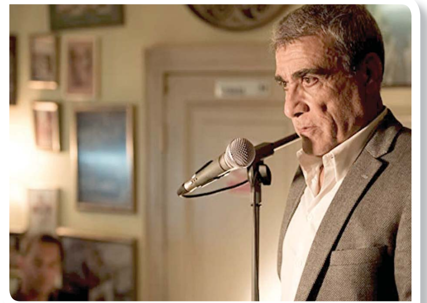
من فيلم «بغداد في خيالي»