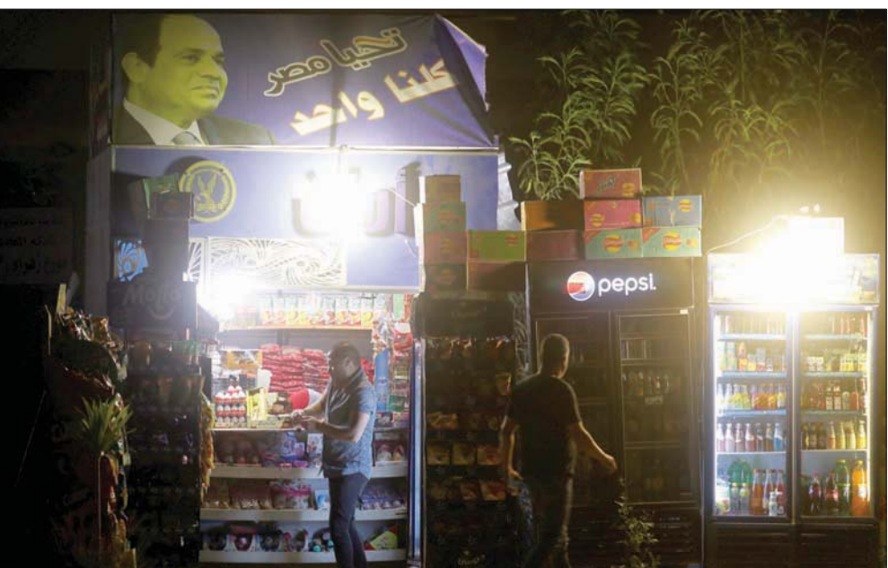
بلغ إجمالي الأموال لمصر في إطار اتفاق ائتماني مدته 12 شهراً 3,6 مليار دولار

العالية على الصحة والتعليم والحماية الاجتماعية». وساعد المنهج القائم على البيانات الذي اعتمده البنك المركزي المصري في سياسته النقدية على تثبيت التوقعات التضخمية وتحقيق معدل متناهي المنخفض ومستقر، ومن المنتظر أن يساهم التحسين النقدي الذي شهدته الشهور الأخيرة في زيادة دعم النشاط الاقتصادي وتخفيف ضغوط ارتفاع سعر الصرف الناشئة عن التدفقات الرأسمالية الكبيرة الوافدة، وهو ما كان له تأثير خافض للتضخم. وتعد مرونة سعر الصرف في الاتجاهين أمراً ضرورياً لاستيعاب الصدمات الخارجية والحفاظ على القدرة التنافسية. وفق البيان. وأشادت نائب المدير العام بصندوق النقد الدولي بالنظام المصرفي المصري، مؤكدة أنه لا يزال النظام المصرفي متمسكاً بالصلاية حتى الآن؛ نظراً لدخوله الأزمة بمستوى جيد من الرسملة والسيولة الوفيرة.