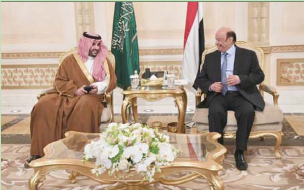
جانبا من لقاء جمع الرئيس اليمني مع نائب وزير الدفاع السعودي في نوفمبر الماضي

وكان الرئيس اليمني عبد ربه منصور هادي أصدر قراراً جمهورياً، الجمعة الماضي، بتشكيل حكومة جديدة من كفاءات سياسية برأسها الدكتور معين عبد الملك، تضم 24 وزيراً، في خطوة تكمل عقد «اتفاق الرياض» اليمني في شقه السياسي بعدما جرى الأسبوع الماضي تنفيذ الشق العسكري له.