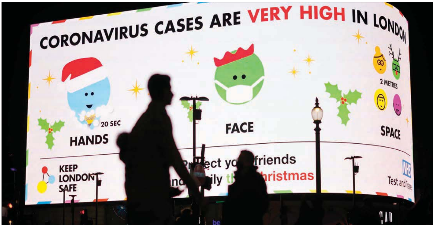
شاشة ضخمة وسط لندن تحذر من ارتفاع الإصابات في المدينة

تعتبر الآن أن هذه السلالة الجديدة (من الفيروس) يمكن أن تنتشر على نحو أسرع». وتابع: «ليس هناك ما يشير في الوقت الحالي إلى أن هذه السلالة الجديدة تسبب ارتفاع معدل الوفيات أو أنها تؤثر على اللقاحات والعلاجات، لكن العمل جار على نحو عاجل للتحقق من توفير حماية أفضل لهم ومن ثم أن نتكمن من رؤيتهم خلال احتفالات عيد الميلاد المقبلة». وقال كريست ويني في بيان إن «المجموعة الاستشارية بشأن التهديدات الجديدة والناشئة لفيروسات الجهاز التنفسي