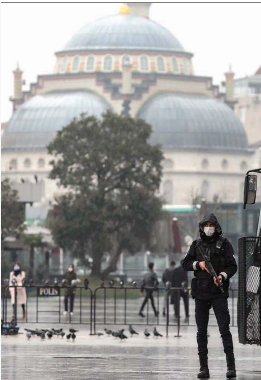
شرطي أمام مقر محكمة في إسطنبول يوم الجمعة خلال النظر في اتهامات ضد ناشط معارض للرئيس التركي

إليها بين أعضائه. وأعرب بوريل عن قلقه إزاء الاتفاق بين تركيا وحكومة الوفاق الوطني في ليبيا الموقع في نوفمبر (تشرين الثاني) 2019، وما أعقبه من أعمال التنقيب التركية التي أصبحت «تحدياً مباشراً» لليونان وقبرص، موضحاً أن تلك الأعمال «خلقت أجواء سلبية للغاية وعرقلت تفعيل الأجندة الإيجابية».