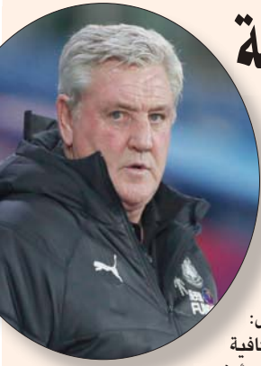
بروس مدرب نيوكاسل يعارض التبدلات الخمسة

ولم يمنح ليفربول مضيفه الكثير من الوقت قبل افتتاح التسجيل بعد تمريرة عرضية داخل منطقة الجزاء من ماني إلى مينامينو الذي راوغ المدافعين وسدد بيميناه في الزاوية الأرضية اليسرى لرمي الحارس الإسباني فنستد غوايتا بالدقيقة الثالثة. وهذا الهدف الأول لمينامينو في الدوري الإنجليزي الممتاز خلال 18 مباراة. كما أنه الهدف الأول لحامل اللقب خارج ملعبه (بعد 125 ثانياً) منذ نوفمبر (تشرين الثاني) 2014. عندما سجل ريكو لامبرت بعد 90 ثانية