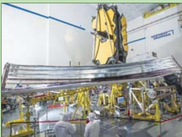
الفنيون يفحصون درع الشمس قبل بدء الاختبارات

ويوضح ستينوارت أن الدرع الكبير، سيقيم المرصد إلى جانب دافئ مواجه للشمس في الصيف المقبل».