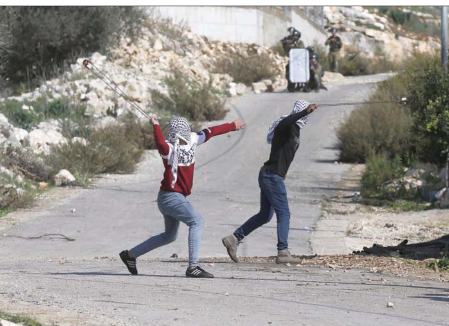
محتجون فلسطينيون ضد المستوطنات الإسرائيلية في كفر قديم قرب نابلس

وأوضحت الخارجية في بيان أن «القرار الإسرائيلي يعني ابتلاع