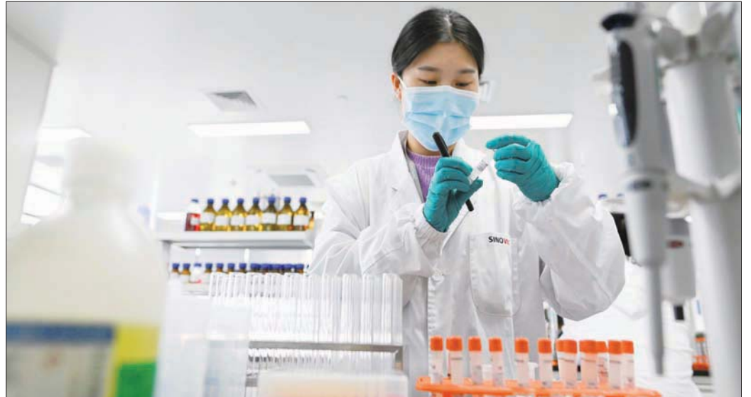
مختبر «سينوفاك» في بكين لتطوير لقاح ضد «كوفيد - 19»