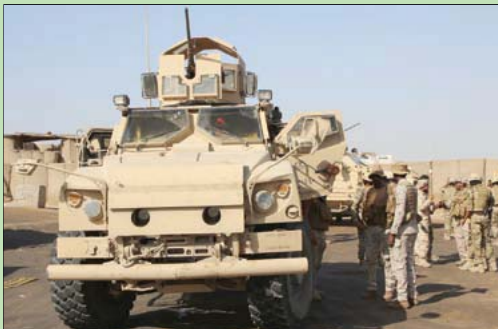
جانبا من القوات السعودية التي أشرفت على تنفيذ الشق العسكري من اتفاق الرياض في عدن

وترسيخ العمل الإداري في وزارتهم بما يتفق ومبدأ المحاسبة ومكافحة الفساد، بعيداً عن التجاذبات السياسية أو الحزبية. وإلى جانب ملف الخدمات الأكثر ثقلًا، سيكون أمام الحكومة الجديدة مهمة تفعيل الإجراءات سواء عبر تحصيل الرسوم القانونية وتنشيط عمل الموائم أو عبر العمل لتصدير المزيد من شحنات النفط والغاز، بالتوازي مع وضع حلول صارمة تكفل عدم عبث الجماعة الحوثية بالاقتصاد والعملية، وحسم ملف واردات موائم الحديد المصلحة رواتب الموظفين. وفي الوقت الذي ينظر فيه الشارع اليمني إلى جملة من الإخفاقات التي راقت أداء الأعمام الماضية من قبل الشرعية والتي كان الراجح فيها هو الجماعة السعودية سواء على صعيد توقف معركة الحديد، أو لجهة استمرار سيطرة الجماعة على قطاع الاتصالات وتطلع وعيها بالساعات الدولية، يتطلع الآن سكان المحافظات المحررة وغير المحررة إلى حلول جذرية تؤكد الثقة بهذه الحكومة، وصولاً إلى حسم الإختلال الأمني والعسكري في بعض المناطق المحررة، بما يكفل توحيد كل الجهود لمفارقة الميليشيات الانقلابية.