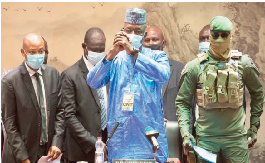
نائب رئيس اللجنة الوطنية للإنقاذ الشعبي الكولونيل مالك دياو وهو أحد الضباط المشاركين في الانقلاب على الرئيس إبراهيم بوبكر كيتا في أغسطس الماضي بعد فوزه برئاسة المجلس الوطني الانتقالي في مالمكو يوم 5 ديسمبر الجاري

«تجلب إلى الطاولة المخالفات الإجرائية ذاتها التي ندندنا بها في الماضي». وأضاف: «حكمتنا مسبقاً بالفشل على الإصلاحات التي نرغب في تطبيقها. مبدأ ذلك الأساسي هو الثقة، وها قد قوضناه بالفعل». وبياتت لدى الجيش أن مصالح المواطنين على المؤسسات المالية اليد العليا على المؤسسات الانتقالية. ومن بين قادة الانقلاب، حصل الكولونيل عصيمي غويتا على منصب مصمم خصيصاً له، وهو النائب المناقد لرئيس عبد الرحمن بن ساماتا توري؛