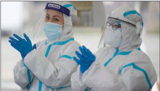
عاملان صحيان في أحد مراكز الفحص بروما أمس

برلين - «الشرق الأوسط» حثت المستشارة الألمانية أنجيلا ميركل المواطنين أمس (السبت)، على تجنب زيارة الأهل في عيد الميلاد وتبادل التهانى عبر مكالمات الفيديو على غرار ما يفعله الجنود خارج البلاد، وذلك للحد من انتشار فيروس «كورونا». وتكافح ألمانيا زيادة في عدد حالات الإصابة والوفاة بفيروس «كورونا». وتحولت الإشادة بميركل بعد ترويضها الموجة الأولى من الجائحة إلى انتقادات ترى أن المستشارة فشلت في التصدي للموجة الثانية. وقالت ميركل في كلمتها الأسبوعية المصورة: «الرجال والنساء المتركون بعيداً عن الوطن للحفاظ على أمننا يعرفون ما يعنيه الاتصال المحدود بالأحبة... إنهم يعرفون معنى عدم القدرة على التواصل لفترة طويلة إلا عن طريق (سكايب) بدلاً من أن يكونوا مع أحبائهم». في إشارة إلى تطبيق (سكايب) للمكالمات المصورة التابع لـ«مايكروسوفت». وذكر معهد روبرت كوخ للأمراض المعدية أن ألمانيا سجلت أكثر من 31 ألف حالة إصابة جديدة و702 وفاة، أمس. ويمثل هذا العدد ضعف حالات الإصابة المسجلة يوم 15 ديسمبر (كانون الأول)، أي قبل يوم من تطبيق ألمانيا عزلاً عاماً صارماً من المتوقع أن يستمر حتى العاشر من الشهر المقبل.