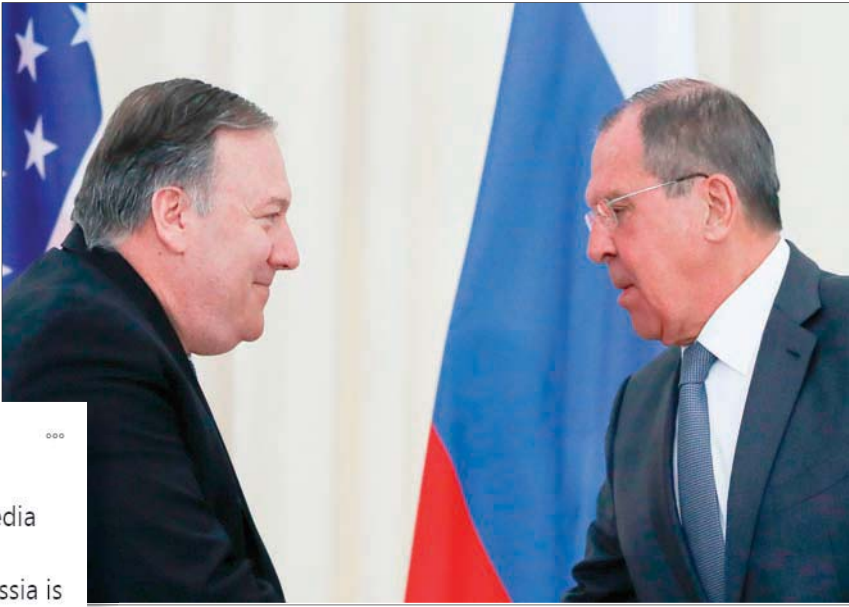
لقاء بين بومبيو ولافروف بستوتشي في مايو 2019 (أفب)

واشنطن، علي بردى قلّل الرئيس الأمريكي المنتهية ولايته دونالد ترمب، أمس السبت، من خطورة الهجوم الإلكتروني واسع النطاق الذي استهدف وكالات حكومية أميركية، مشيراً إلى أنه «تحت السيطرة»، مقوّضاً تقييم إدارته بأن روسيا مسؤولة عنه ومناقضاً تصريحات وزير اللجنة الفيدرالية لتنظيم الطاقة،