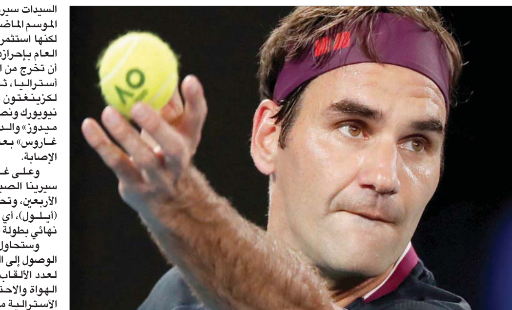
فيدرر يتطلع للعودة إلى منافسات التنس بعد عام من الغياب

السيدات سيرينا ويليامز حصلت الموسم الماضي على ست فرص، لكنها استثمرت واحدة فقط أوائل العام بإحرازها لقب أوكلاند قبل أستراليا، ثم ربح نهائي دورة لكزنيغتون ونجم نهائي دورة نيويورك ونصف نهائي «فلاشينغ ميدوز» والدور الثاني لـ «ولان غاروس». بعد انسحابها بسبب الإصابة.