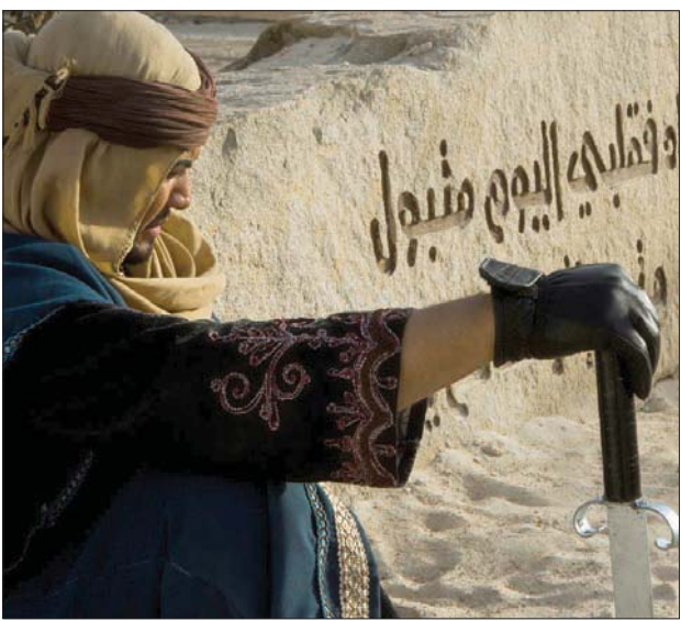
سوق عكاظ اليوم تجسيد قديم لـ«المكان الثالث»

نجد مجالس المنصور مثلاً تتسم بالبساطة والتواضع، والبعد عن مظاهر الترف والأبهة. وقد وصف أحد الداخخين على المنصور مجلسه، قائلاً: «دخلت... ثم صبرت إلى حجرة صغيرة، فيها بيت واحد. وفي البيت مسح ليس فيه شيء غيره إلا فراشه...». وهذه الظروف تتنح العفوية في اللقاءات، وتتفق مع السمات التي تحدثت عنها أولدنبورغ في وصفه للمكان الثالث في أواخر الثمانينيات.