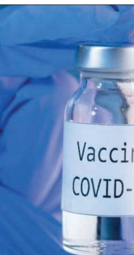
لقاح شركة «موديرنا» ضد «كورونا»

جرعتين من اللقاح أو الدواء الوهمي، بفواصل أربعة أسابيع، وتتبع الباحثون حالات «كوفيد - 19» وأوضح أنه بعد أسبوعين من أخذ الجرعة الثانية بدأت تظهر بعض الأعراض، ولكن كان لقاح «موديرنا» فعلاً بنسبة 94.1%، وفي المرحلة الأخيرة من التجربة، كان اللقاح فعالاً عبر المجموعات العرقية والأثنية، فضلاً عن الأعمار.