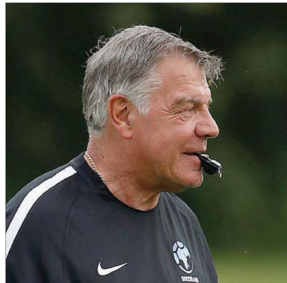
الأردايس يعود لخوض تجربة إنقاذ جديدة مع نادي وست بروميتش

بيليتش أعرب عن شعوره بخيبة أمل كبيرة بعد إقالته من تدريب وست بروميتش؛ لكنه قال إنه رحل عن النادي «برأس مرفوعة»، وكان بيليتش الضحية الأولى بين مدربي الدوري الممتاز هذا الموسم، بعدما حصد فريقه سبع نقاط فقط. وقال بيليتش: «أنا حزين لأن الأمر لم ينجح بالطريقة التي أردناها؛ لكنني أرسل برأس مرفوعة... وبكل صدق أتمنى التوفيق للنادي في المستقبل». وسيكون الأردايس أمام تحدٍ صعب في أول مباراة يخوضها مع وست بروميتش في مواجهة المقلعة؛ ولكي يفهم الأسباب التي جعلت مسؤولي وست بروميتش البيون على التعاقد مع الأردايس، يجب أن نلقي نظرة على ما حدث في إيفرتون بعد إقالة رونالد كومان والتعاقد مع ماركو سيلفا، وما حدث في كريستال بالاس بعد إقالة الآن بارديو وتعيين فرانك دي بوير. أما في وستهام يونبايتد، فقد كان يُنظر إلى بيليتش على أنه الحل الأمثل لقيادة الفريق إلى بر الأمان بعد أربع سنوات من وجود الأردايس على رأس القيادة الفنية للفريق. والآن، بات الأمر معكوساً في وست بروميتش البيون الذي سيحاول الأردايس في هذا الوقت الذي كما لا يوجد به عدد كافٍ من اللاعبين الهادفين القادرين على استغلال أنصاف الفرص. فهل لدى الأردايس حل مبتكر لأي من هذه المشكلات؛ أم أنه سيقوم بكل بساطة بالاستغناء عن اللاعبين المتواضعين، ويعتمد على ما تبقى من اللاعبين وفق طريقة الدوران!