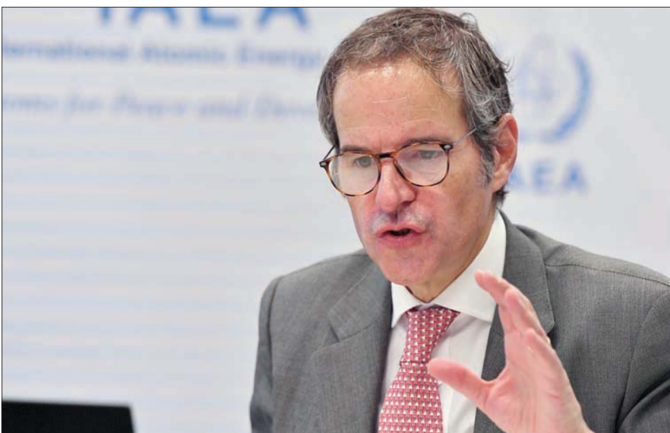
المدير العام للوكالة الدولية للطاقة الذرية خلال مشاركة عبر الفيديو في منتدى التعاون النووي

وقال أبرامز إن إيران «حاجة ماسة إلى تخفيف العقوبات التي فرضتها الولايات المتحدة، وهذا سيكون عاملاً