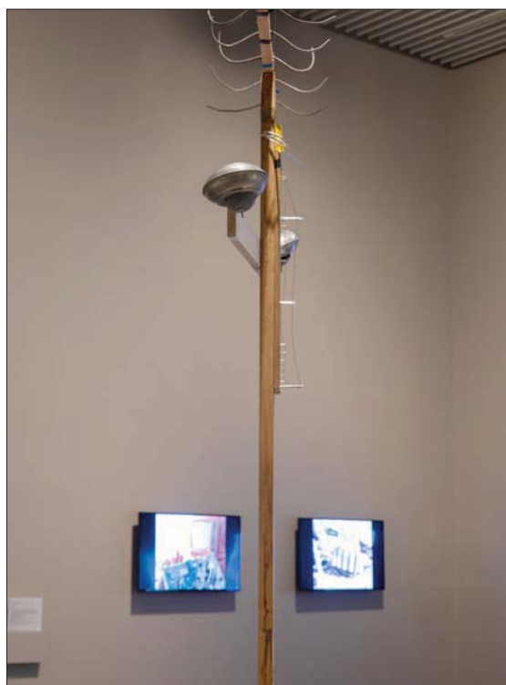
من معرض الفنان هيو ك

فكردستان مثل الوادي والدول المجاورة لها مثل الجبال؛ فكل «دمار مشترك»، ويتكون من بساط مطبوع عليه صورة جوية لمدينة بغداد. العمل نفذته بتكليف من «مركز جميل للفنون»، لكنه يومي لعمل سابق للفنان اسمه «نظرة من أعلى». يقول «أول ماهايم الألمانية، ولديهم أكبر معمل للمواد الكيميائية، بين ذلك وبين الأسلحة الكيميائية التي استخدمها صدام حسين ضد حلبجة وكانت الألمانية الصنع، «طبعت على سجادة كبيرة صورة جوية للمدينة الألمانية التقطها طيار نازي في عام 1943». وتمت دعوة الجمهور للجلوس على السجادة ومشاهدة الفيلم المصاحب، «نكرناهم بمدنيتهم التي دمرت في ذلك الوقت، لكنها الآن تشارك في تدمير بلاد أخرى. وفي عملي الحالي هنا أتحدث عن مدينة من العراق ولكن بالفديو نرى مدينة كاستل التي دمرت في الحرب العالمية الثانية، والآن لديها مصنع كبير للأسلحة يصدر منها للعراق».