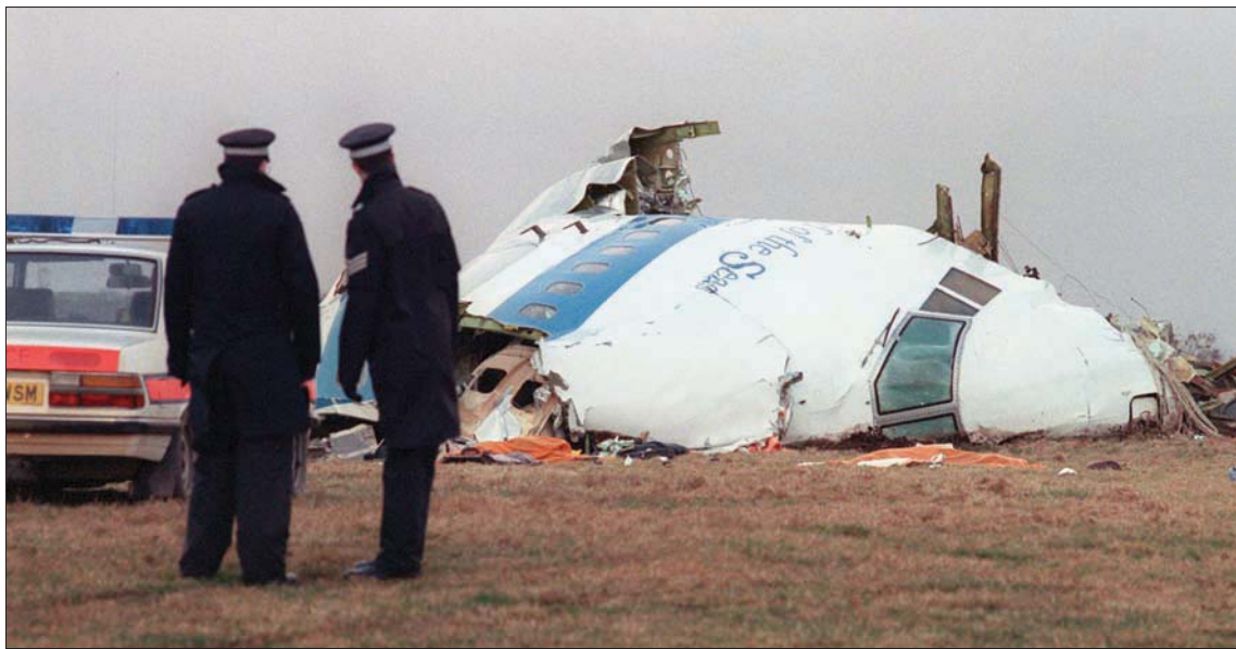
صورة أرشيفية لبقايا الطائرة التي تحطمت فوق سماء لوكربي الاسكتلندية