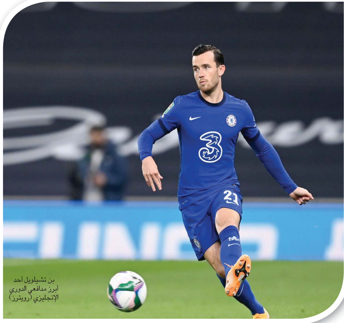
بن تشيلويل أحد أبرز لاعبي الدوري الإنجليزي

صفوف المنتخب الإنجليزي، كما أقام علاقة قوية مع المهاجم الألماني تيمو فيرنر. يقول بن تشيلويل عن فيرنر: «إننا نلعب معاً في الجانب نفسه من الملعب، ومن المهم للغاية أن نكون متفاهمين جداً. إنه رجل مرح ومرح، ولا يمكنك أن ترى عليه علامات الانزعاج. وحتى بعيداً عن كرة القدم، لا يمكنك أن تراه غاضباً أبداً». وقبل الخسارة أمام إيفرتون مساء السبت الماضي بهدف دون زياش يمثلون إضافات قوية للغاية ولافتة للانتظار في خط هجوم تشيلسي، فإن الحرية التي يمنحها لامبارد لظهوري الجنب قد ساهمت كثيراً في تحسين أداء الفريق في الثلث الأخير من الموسم. ويقدم بن تشيلويل مستويات استثنائية خلال الموسم الحالي. ويعدما غاب اللاعب عن بداية الموسم بسبب تعرضه للإصابة في كعب القدم، عاد وأذهل الجميع بالأداء القوي الذي قدمه في أول مباراة له بقميص «البلوز»، حيث سجل الهدف الافتتاحي في المباراة التي سحق فيها تشيلسي نظيره كريستال بالاس برعاية نادي تشيلسي في أكتوبر (تشرين الأول) الماضي، ثم صنع هدفاً لكورت زوما بتمريرة رائعة. وواصل بن تشيلويل تقديم مستوياته الجيدة وكان دائم الخطورة على مرعى الفرق المنافسة، وسجل مرة أخرى الشهر الماضي في المباراة التي فاز فيها تشيلسي على شيفيلد يونايتد بعد تلقيه تمريرة سحرية من المغربي حكيم زياش.