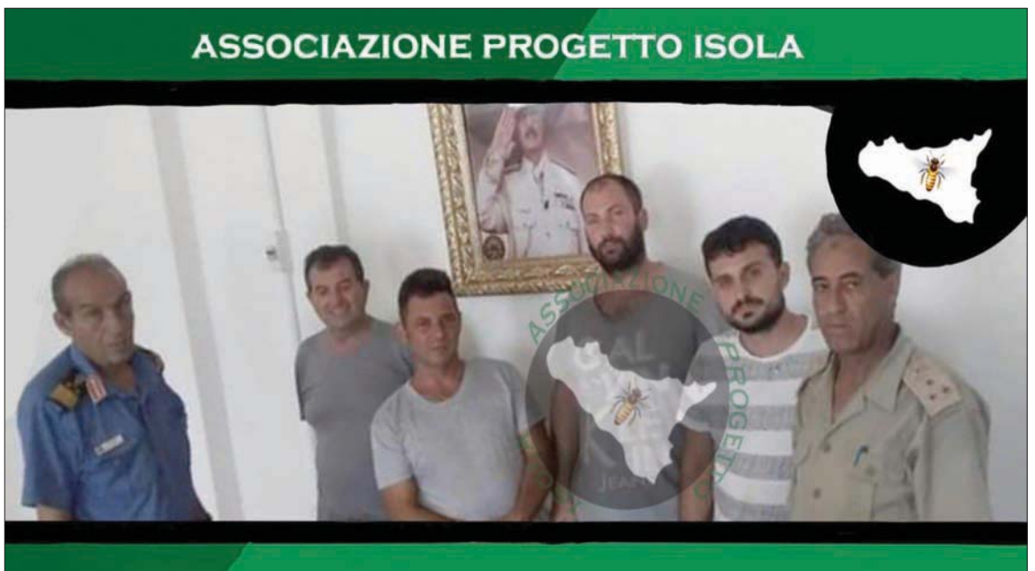
صورة التقطت بالفيديو لعدد من الصيادين الإيطاليين الذين تم إطلاق سراحهم في بنغازي

بدوره، قال أغان إن لقاء مع السفير الأميركي، الذي كان بحضور اللواء أحمد أبو شحمة، أمر غرفة العمليات الميدانية بـ«مركان الغضب»، وعضو لجنة (5+5)، ناقش أفق التعاون الأمني، ومخرجات حوار مدينة غدامس. إلى ذلك، أعلنت وزارة الداخلية بحكومة الوفاق أن اللجنة المكلفة بدمج قوات الثوار داخل المؤسسة الأمنية، ناقشت مساء أول من أمس الخطط والإجراءات المتخذة بشأن استيعاب ودمج المقاتلين بالوزارة، من خلال الخطط التدريبية لتأهيلهم للانخراط في العمل الأمني والشرطة. وأوضح في بيان أن الاجتماع، الذي عقد بديوان مديرية أمن الجفارة، تحت رئاسة العميد عبد الناصر الطيف، رئيس اللجنة وحضور أعضائها، بحث المشاكل والعراقيل التي تواجه اللجنة، وسبل إيجاد حلول لها، بما يضمن الوصول إلى نتائج إيجابية تخدم الصالح العام.