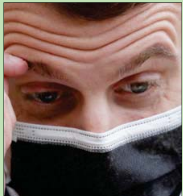
ماكرون لدى حديثه إلى رئيس الوزراء البرتغالي الريعاء