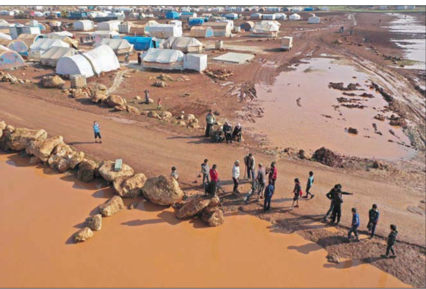
نازحون بعد أمطار غزيرة في ريف إدلب شمال غربي سوريا أمس

وبالتزامن، واصلت قوات النظام قصفها الصاروخي على مناطق وليفيلج وسقوف والفطرية وكنصخرة بريف إدلب الجنوبي، والعكواي بسهل الغاب شمالي غربي حماة، كما شهد محاور المشاريع بسهل الغاب، استهدافات متبادلة بالرشاشات الثقيلة، بين قوات النظام والمسلحين المواليين لها من جانب، وفصائل المعارضة المسلحة من جانب آخر.