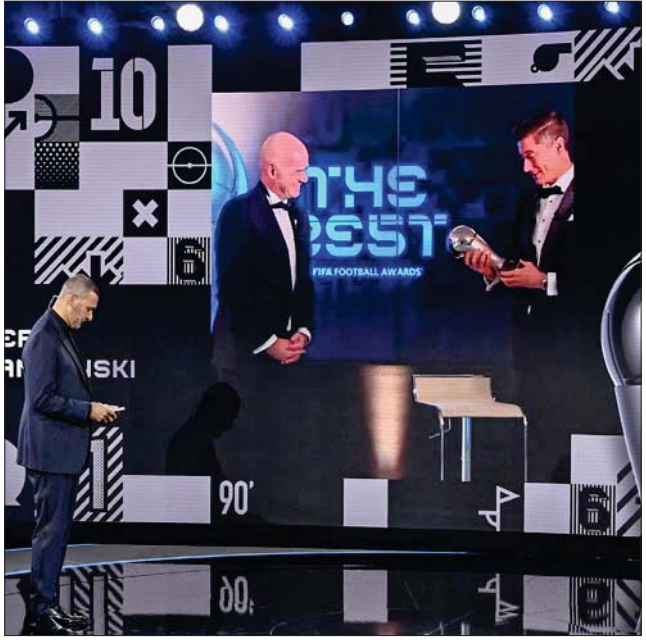
ليفاندوفسكي على الشاشة يتلقى جائزة الأفضل بالعالم من خلال الحفل الافتراضي

مانويل نوير، جائزة أفضل حارس مرمر متفوقاً على البرازيلي اليسون بيكر والسلوفيني يان أوبلاك حارس مرمر أتلتيكو مدريد الإسباني. فيما أحرزت الفرنسية سارة بوهدي لاعبة ليون للسيدات جائزة أفضل حارسة مرمر لدورها في فوز فريقها بالثلاثية (دوري وكأس فرنسا ودوري أبطال أوروبا)، وتفوقت على كريستانتى إندير حارسة باريس سان جيرمان الفرنسي ومنتخب تشيلي، والأميركية اليسا نايبير حارسة مرمر شيكاغو ريد ستارز، والتي قادت منتخب بلادها للفوز ببطولة اتحاد كوكاكاف (أميركا الشمالية والوسطى والكاريبي) المؤهلة لأولمبياد طوكيو. ونال الكوري الجنوبي، سون هونغ مين، جائزة بوشكاش لأفضل هدف في العالم الذي سجله في مرمر بيرنلي بالدوري الإنجليزي. وفرض لاعبو بايرن ميونخ وليفربول هيمنتهم على التشكيلة المثالية لمنتخب العالم حيث 4 لاعبين من بطل ألمانيا و3 من بطل إنجلترا. وفرصت لاعبات الدوري الفرنسي والإنجليزي هيمنتهم على التشكيلة المثالية (منتخب العالم للسيدات)، حيث ضمت 4 لاعبات من البطولات.