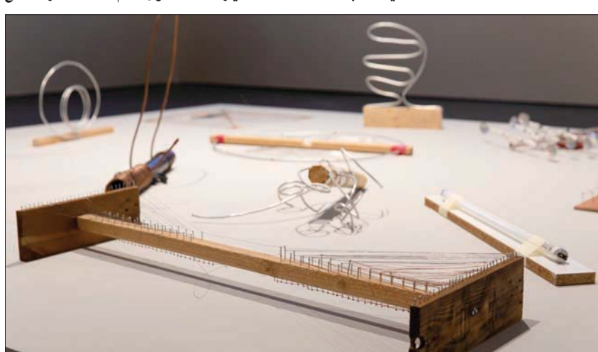
أودت حضر بين العروض

فكردستان مثل الوادي والدول المجاورة لها مثل الجبال؛ فكل «دمار مشترك»، ويتكون من بساط مطبوع عليه صورة جوية لمدينة بغداد. العمل نفذته بتكليف من «مركز جميل للفنون»، لكنه يومي لعمل سابق للفنان اسمه «نظرة من أعلى». يقول «أول ماهايم الألمانية، ولديهم أكبر معمل للمواد الكيميائية، بين ذلك وبين الأسلحة الكيميائية التي استخدمها صدام حسين ضد حلبجة وكانت الألمانية الصنع، «طبعت على سجادة كبيرة صورة جوية للمدينة الألمانية التقطها طيار نازي في عام 1943». وتمت دعوة الجمهور للجلوس على السجادة ومشاهدة الفيلم المصاحب، «نكرناهم بمدنيتهم التي دمرت في ذلك الوقت، لكنها الآن تشارك في تدمير بلاد أخرى. وفي عملي الحالي هنا أتحدث عن مدينة من العراق ولكن بالفديو نرى مدينة كاستل التي دمرت في الحرب العالمية الثانية، والآن لديها مصنع كبير للأسلحة يصدر منها للعراق».