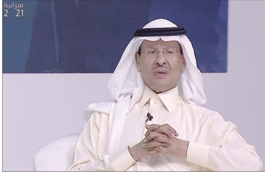
الأمير عبد العزيز بن سلمان خلال جلسات ميراثية السعودية أمس

شدد وزير الطاقة السعودي الأمير عبد العزيز بن سلمان على أن اتفاق «أوبك بلس» أنقذ الصناعة النفطية العالمية، مؤكداً أن هذه السوق تدار بالتفاهات فقط، ولا يمكن إخضاعها لمفهوم حرية السوق. وأشاد الوزير في ملتقى للميراثية السعودية الذي تنظمه وزارة الطاقة حول تحديات أسواق الطاقة العالمية، إلى أن التزام «أوبك بلس» بالاتفاق الأخير كان الأقوى مقارنة بالاتفاقيات السابقة، لافتاً إلى أن زيادة بلاده للإنتاج مطلع الجائحة كان أمراً مقصوداً، وقال «في ديسمبر (كانون الأول) احتفلنا بدورنا القيادي في إدارة سوق النفط»، وقال «عادتنا لنا العزة باننا الأقوى والأمكن في إدارة سوق النفط».