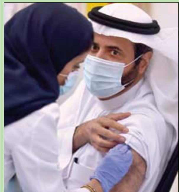
وزير الصحة السعودي توفيق الربيعية يتلقى اللقاح أمس