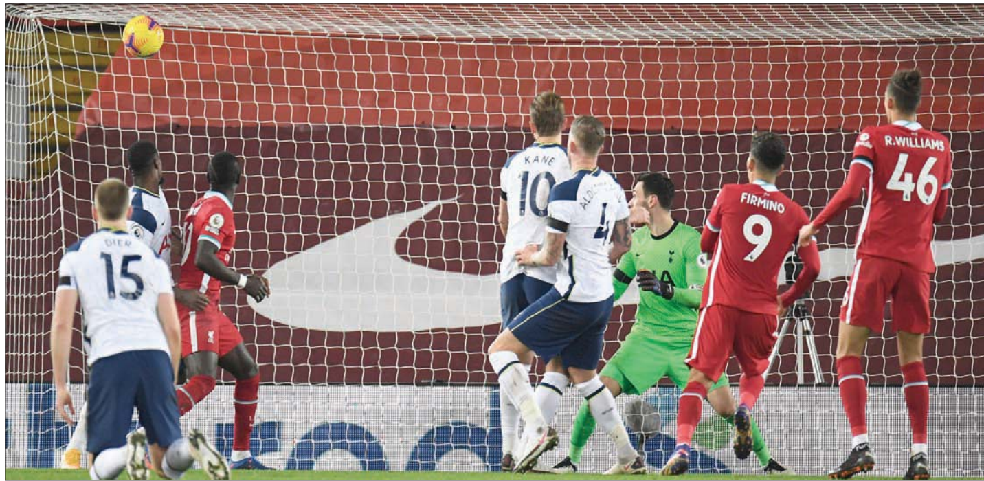
فيرمينو نجم ليفربول (رقم 9) يراقب تسديدته الراسية وهي تسكن شبك توتنهام في الوقت القاتل (أ.ب)

واكتسح لينز يوناييتد ضيفه نيوكاسل 5 - 2، وسجل للينز باتريك بامفورد في الدقيقة (35)، والإسباني رودريغو (61)، والإيرلندي الشمالي ستيوارت دالاس (77)، والمقدوني إشكان اليوسكي (85) وجاك هاريسون (88)، فيما سجل الأيرلندي جيف هندريك في الدقيقة (26) ومواطنه كياران كلارك (65) هدفي الضيوف. على جانب آخر وافقت أندية الدوري الإنجليزي الممتاز أمس من حيث المبدأ على تغييرات إضافية