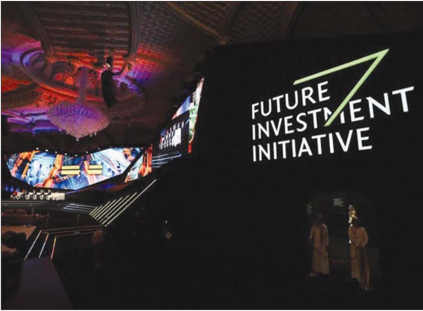
الدراسة أدرجتها مؤسسة مبادرة مستقبل الاستثمار في تقريرها الثالث لسلسلة «تأثير»

وفي حديثه عن الفرصة المتاحة أمام أفريقيا لتجاوز حلول الرعاية الصحية التقليدية وإدخال التطبيقات التكنولوجية الجديدة، تقول دكتور بينا غواهو: «سننتهز أي فرصة للتطوير والانتقال إلى المستقبل ما لا تكون متاحة أمامنا. هذا ما حققناه في علاج الإيدز وفي تنفيذ برنامج اللقاحات».