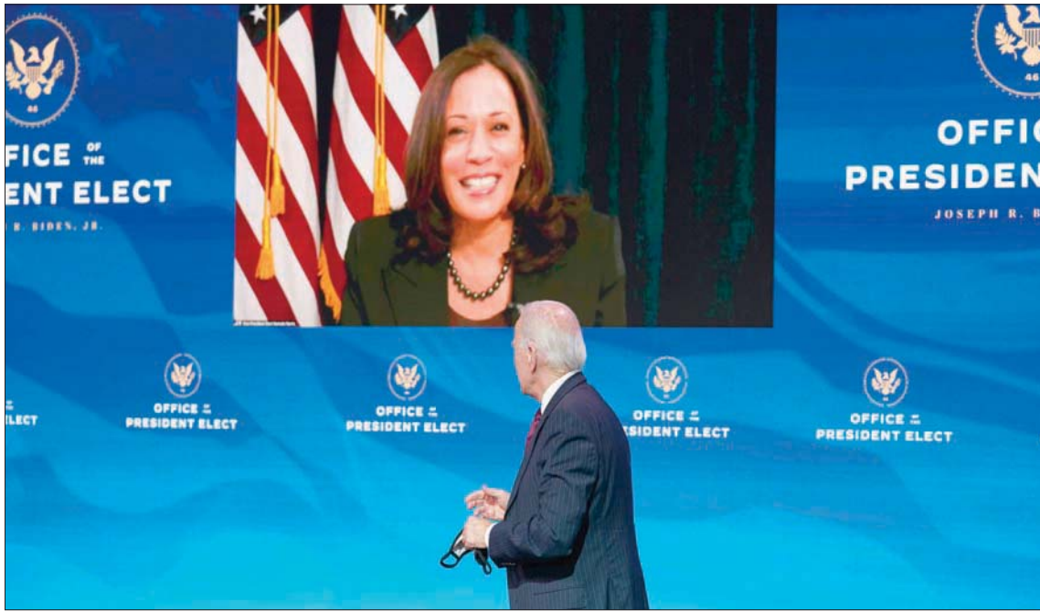
جو بايدن ونائبته كامالا هاريس خلال الإعلان عن تعيينات جديدة في إدارته أول من أمس بولاية ديلاوير

في غضون ذلك، أفادت تقارير أن بايدن يدرس تعيين المنتخج السينمائي جيفري كاتزنبيرغ والرئيس التنفيذي لشركة ديزني، بوب إيغر، في دورين رئيسيين يجعلهما من الأعضاء المهمين في الفريق الدبلوماسي للرئيس المنتخب.