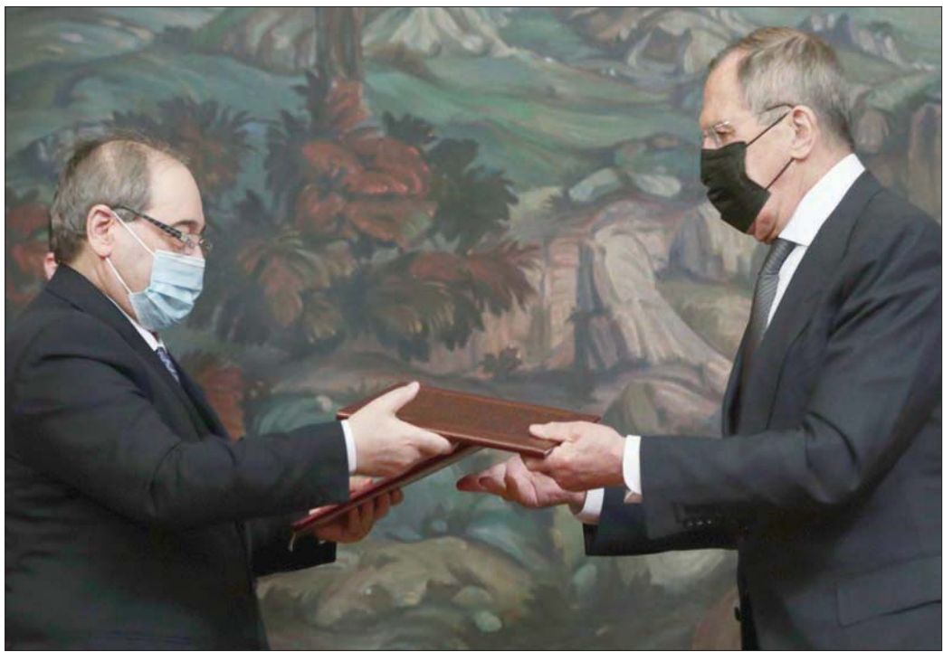
وزير الخارجية الروسي سيرغي لافروف والسوري فيصل المقداد في موسكو أمس

شحنة قمح بحجم 100 طن، وهذه الدفعة الأولى من مساعدات أخرى قادمة». وزاد أنه تم تعيين رئيس جديد من الجانب الروسي للجنة الحكومية الروسية السورية، وستعقد هذه اللجنة اجتماعاً، مطلع العام المقبل.