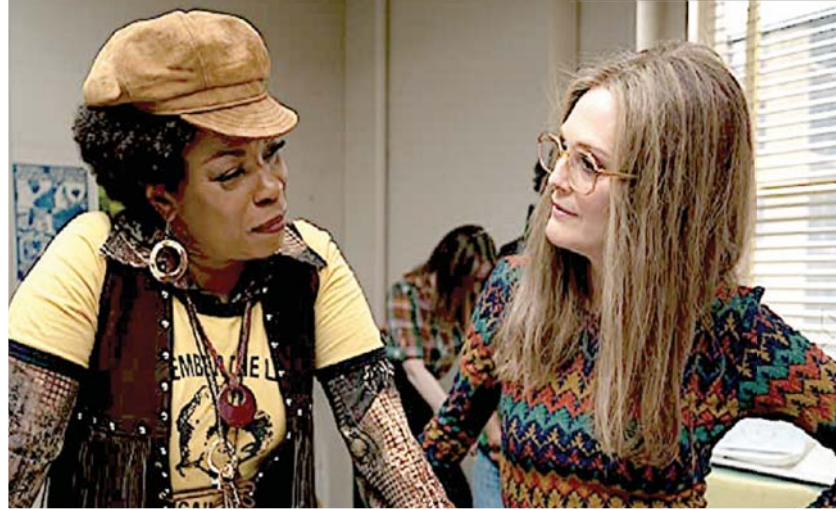
من فيلم جولي تايمور «غلورياس»

عقبات السيدة» لطارق شلبي. صندانس في البيت