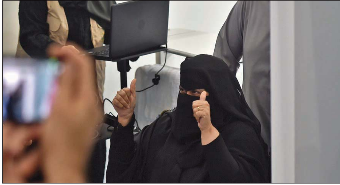
أول سيدة سعودية تتلقى اللقاح تشير بعلامة الثقة

جميع مناطق المملكة، مشيدا بجهود اللجان العلمية المختلفة، في متابعة سلامة الجميع وسلامة