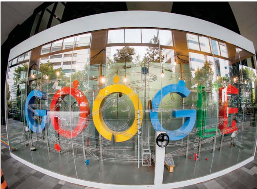
فتحت الولايات المتحدة وأوروبا جبهة تصادم جديدة مع كبريات شركات الإنترنت

إبنايت استغلال موقع مهيمين ليس بالمسألة السهلة. ووصفت «غوغل» من جهتها هذه الإجراءات ب«المخنطة إلى حد بعيد».