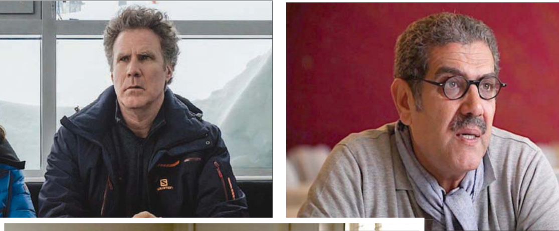
المخرج رضا الباهي