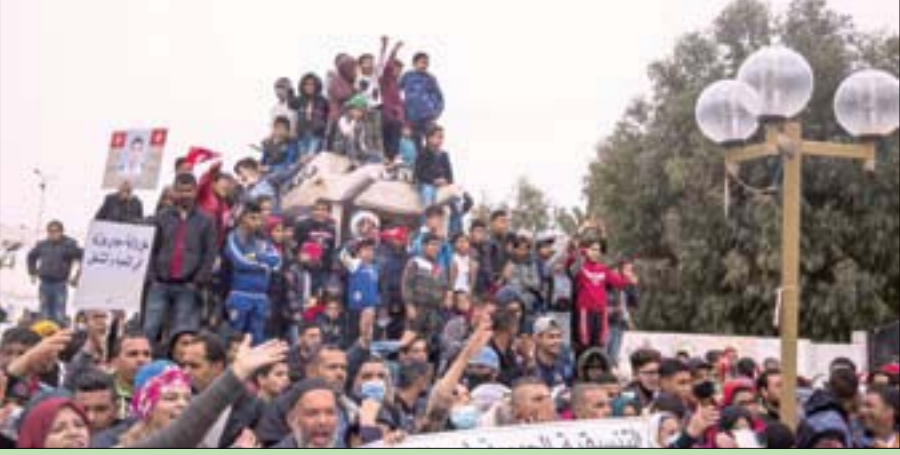
تونسيون خلال إحياء ذكرى انطلاق الثورة في ساحة محمد البوعزيزي بمدينة سيدي بوزيد أمس