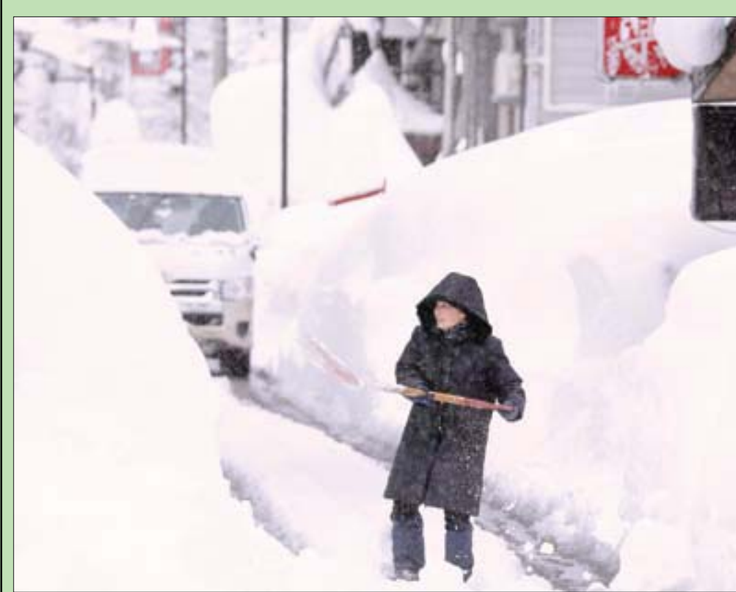
امرأة تزيل الثلوج في شارع بمدينة يوداواوا في مقاطعة نيجاتا

طوكيو، «الشرق الأوسط» علقت نحو ألف سيارة وسط عاصفة ثلجية هائلة ضربت شرق اليابان متسببة في تساقط كثيف للثلوج في المنطقة، حسبما أفادت وسائل إعلام محلية. وأفادت وكالة كيودو للأنباء بأن عدد السيارات العالقة على طريق كان - إيتسو السريع المغطى بالثلوج بين بلدة تسوكيونو وبلدة يوزاوا شمالي طوكيو ارتفع إلى حوالي ألف سيارة. وقال أحد السائقين لهيئة الإذاعة اليابانية إنه وزميله كانا في السيارة حين تقطعت بهما السبل تحت الثلوج الكثيفة لمدة تسع ساعات. وأضاف: «المشكلة أننا لم نستطع الذهاب لدورة المياه». وأدى تجدد تساقط الثلوج إلى تراكمها إلى 181 سنتيمتراً في يوزاوا وإلى 88 سنتيمتراً في مدينة أونوما، وفقاً لوكالة كيودو. وعلقت نحو 200 سيارة بشكل مؤقت في الثلوج الكثيفة في طريق جوشينيتسو السريع بوسط اليابان. وحذرت هيئة الأرصاد الجوية اليابانية من انهيارات ثلجية ومزيد من الاضطرابات المرورية في شرق ووسط اليابان والمناطق الساحلية في بحر اليابان، حيث من المتوقع سقوط المزيد من الثلوج على مناطق واسعة من البلاد.