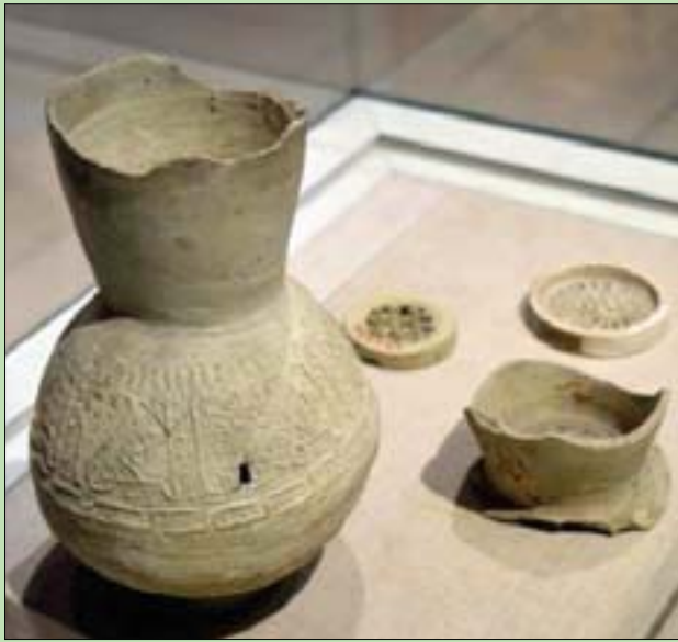
إناء مياه أثري (الشرق الأوسط)