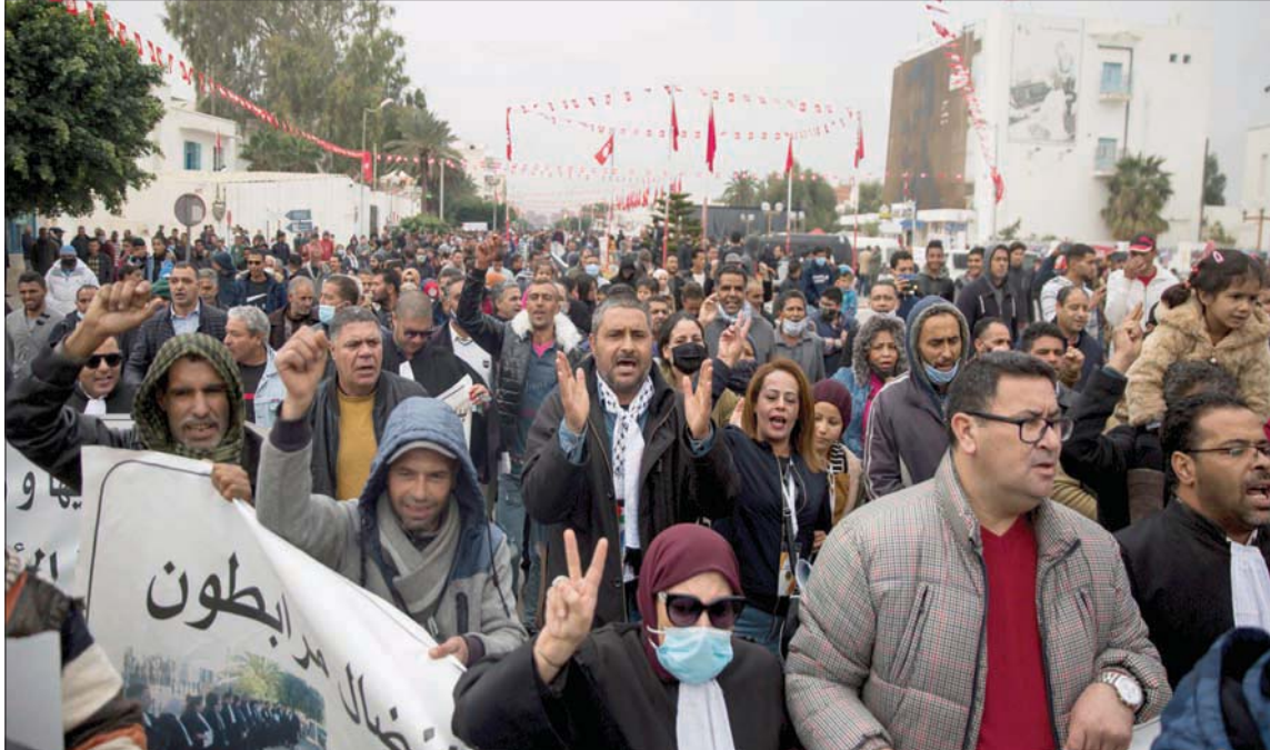
تونسيون تجمعوا أمس وسط ساحة محمد البوعزيزي الذي فجر «ثورة الياسمين» في مدينة سيدي بوزيد مهد الثورة (أ.ب)

تونس: المتج السعيداني لندن: «الشرق الأوسط»