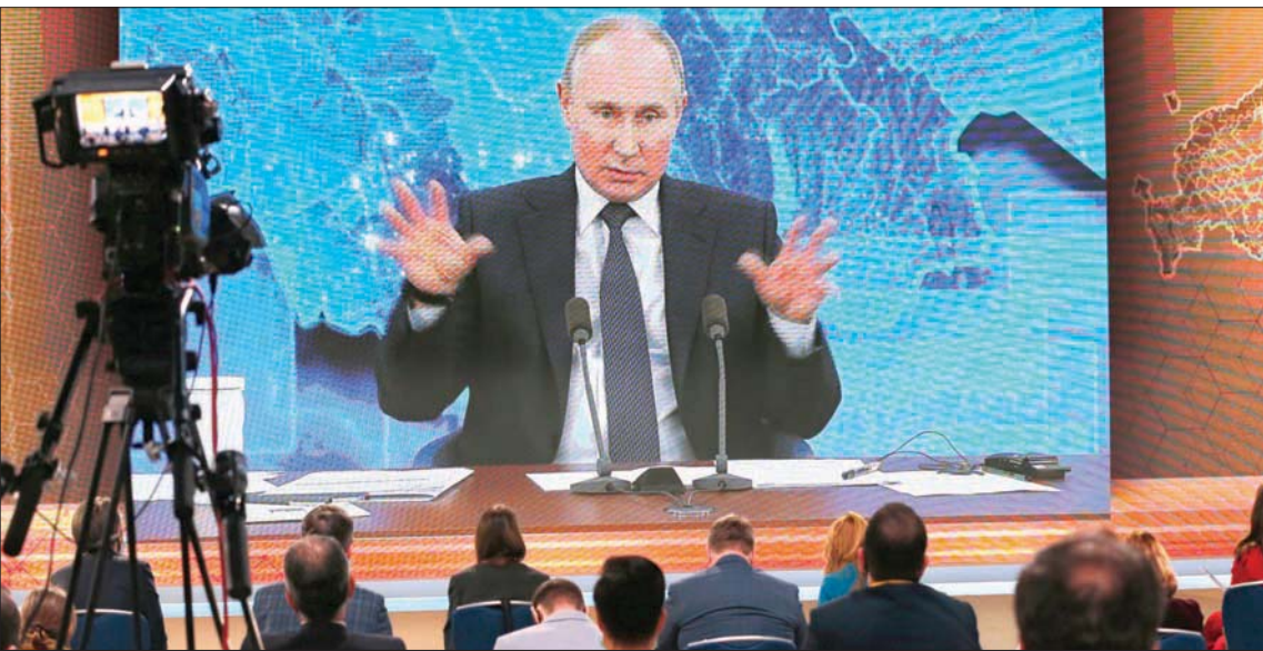
الرئيس الروسي يتحدث في مؤتمره الصحافي الافتراضي في موسكو أمس

«أصبحت البنية التحتية العسكرية للنازو أقرب إلى حدونا».