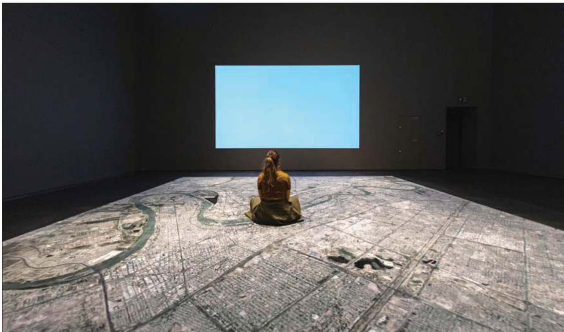
صورة جوية لبغداد من معرض الفنان هيو ك «هل تتذكرون ما تحرقون؟» في «مركز جميل للفنون» بدبي (دانيلا بابيتستا)

يقام حالياً في «مركز جميل للفنون»، مؤسسة الفن المعاصر في دبي، معرض «هل تتذكرون ما تحرقون؟»، وهو المعرض المنفرد الأول للفنان الكردي هيو ك، في آسيا والشرق الأوسط، والذي يلقي الضوء على أكثر من عشر سنوات من أعمال الفنان الذي يستحضر في العديد من أعماله المعرض مسقط رأسه، مدينة السلمانية في كردستان العراق، وتجاريه في الفراق لاحقاً، ومن ثم العودة بعد سنوات طوال. الحديث مع الفنان هيو ك، يتشعب ويتركب أبواباً كثيرة وينير شؤوننا وشجوننا لدى الفنان. وما بين الوطن الذي اضطر الفنان إلى مغادرته في التسعينات، وما بين السياسة التي حكمت عالمه وأثرت على عمله، ينطلق حوارنا.