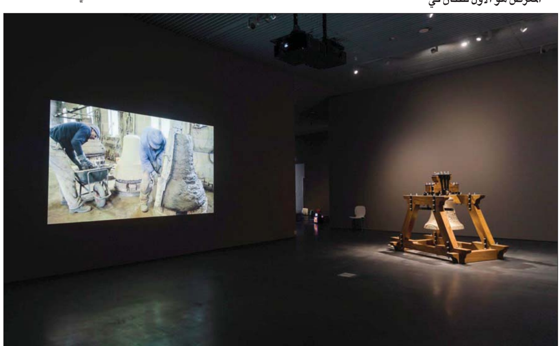
من معرض الفنان الكردي في دبي (دانيلا بابيتستا)

أقول له «أقارت تعبيراً لك بأن كردستان مثل البيزنا المقطعة إلى أربعة أقسام»، يقول «كردستان مثل قرص البيزنا، 40 مليون شخص ليس لدينا دولة ونعيش كاقليات في دول. ولكن وضعنا أيضاً به احتمالات كثيرة،