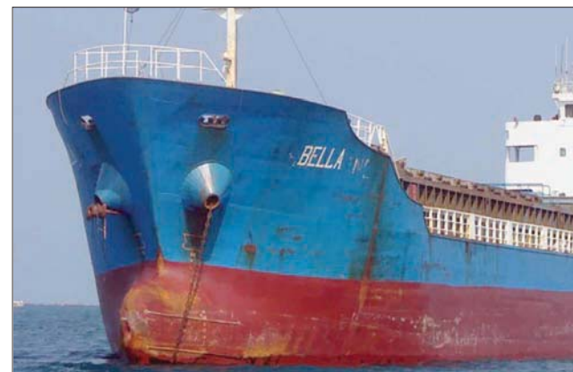
عقوبات الإدارة الأمريكية الحالية شملت قطاع الطاقة الإيراني

على إيران عضو منظمة أوبك أتى إلى تقليص إيراداتها النفطية وعرقلت تجارتها الخارجية. ونات أغلب الدول والشركات بنفسها عن إيران بسبب الخوف من أن تتركب هي نفسها للعقوبات بسبب التعامل مع طهران. ومع ذلك استمر ترمب في زيادة الضغوط بفرض إجراءات جديدة لفريق بايدن: «نقطة قوة من الإجراءات التي تحاول بها الإدارة الحالية وهي في طريقها للرحيل... إحداث المزيد من الألم الاقتصادي والاحتلال البرنامج النووي الإيراني وتعقيد مسيرة بايدن». غير أن مسؤولي إدارة ترمب يردون على ذلك بالقول إنهم يحسنون إلى بايدن من الضغوط الاقتصادية التي يواجهها على إيران حتى لا يكون أمامها خيار سوى العودة إلى المفاوضات.