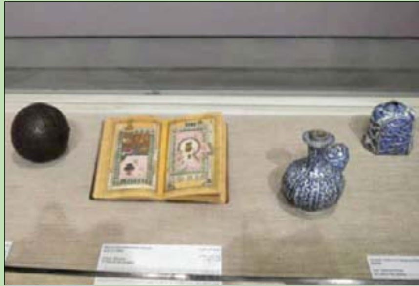
مجموعة متنوعة من المعروضات (الشرق الأوسط)