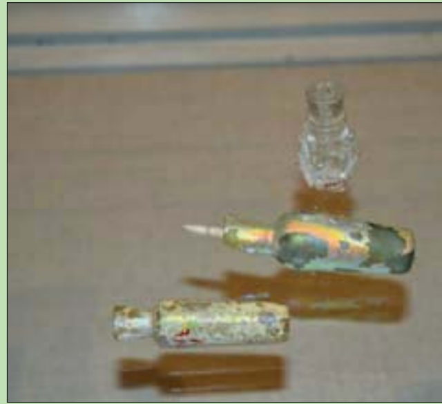
مجموعة كؤوس زجاجية كانت تستخدم في العلاج بالجمامة (الشرق الأوسط)