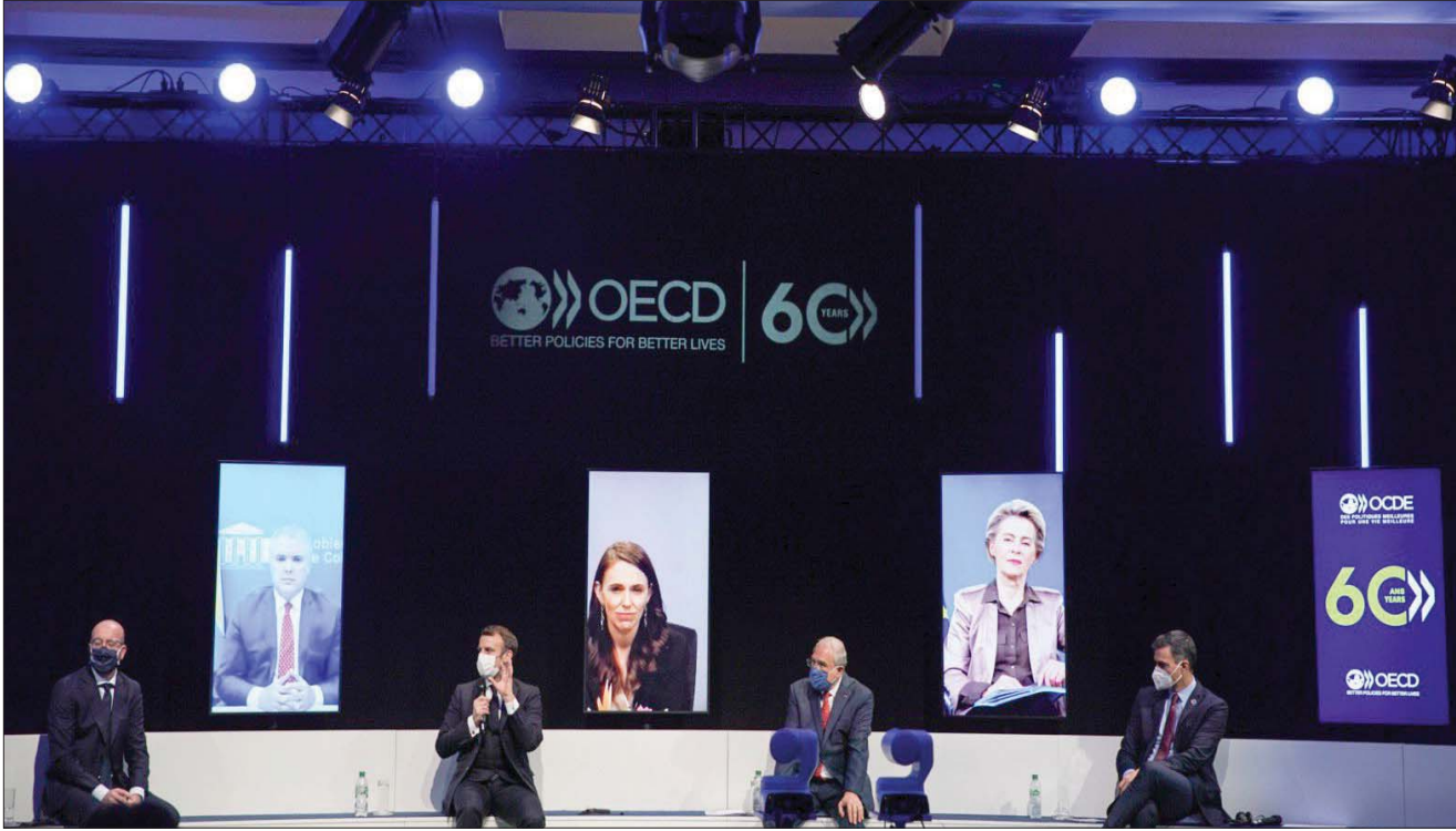
ماكرون متحدثاً في اللقاء الأوروبي قبل ثلاثة أيام