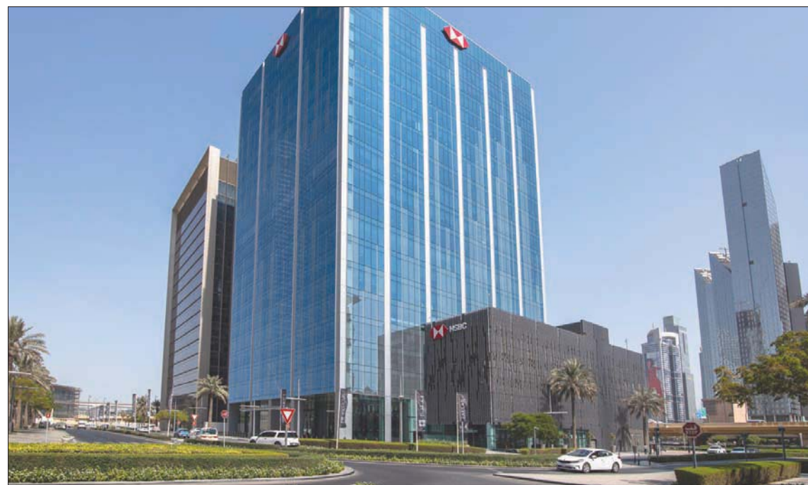
الظروف الصعبة خلال العام الحالي لم تؤثر على الحالة المزاجية بين شركات الأعمال (الشرق الأوسط)

على المستوى العالمي - وبينها 18 في المائة من الشركات في الإمارات التي إما متقدمة أكثر في توقعاتها، وإما تتوقع العودة إلى تحقيق الربحية بحلول نهاية هذا العام. كما يكشف التقرير أيضاً عن أن شركات الأعمال في الإمارات تدرج الحاجة إلى الاستثمار من أجل تحقيق النمو المستقبلي، حيث تعززت 81 في المائة من الشركات المشاركة في الدراسة زيادة حجم استثماراتها في أعمالها في العام المقبل، مقارنة بـ 67 في المائة على المستوى العالمي. ومن أهم ثلاث أولويات استثمارية لدى الشركات في الإمارات، وفق الدراسة، الاستثمار في مجال الابتكار في المنتجات، والعمليات، وتحسين تجربة العملاء. وفي حين أن 74 في المائة من شركات الأعمال في الإمارات ترى أن الخنجر الدولية قد أصبحت أكثر صعوبة بسبب تأثير الأحداث التي جرت خلال الأشهر الـ 12 الماضية، فإن التزامها بمتابعة الفرص الدولية لا يزال يبدو ثابتاً ولم يتغير.