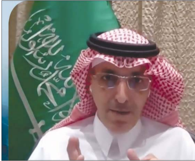
وزير المالية السعودي خلال ندوة الاستقرار المالي الافتراضية أمس

وأكد أن الأزمة ستخلق فرصاً للمستثمرين، مشيراً إلى أن القطاع الصناعي سيكون من أفضل القطاعات الواعدة في جذب الاستثمارات الخارجية، وقال «هذا ما نعمل عليه بالتعاون مع وزارة «ساما» تراقب جودة الأصول في القطاع لتوطين الصناعات وجذب الاستثمارات الخارجية».