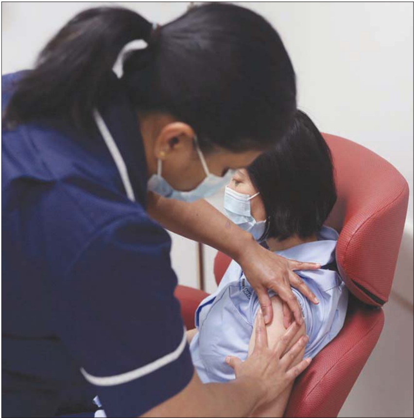
المرضون يتدربون على طريقة استخدام لقاح «فايزر» قبل بدء حملة التطعيم

بريطانيا بالطائرات الحربية بموجب خطط طوارئ وضعتها الحكومة البريطانية لتجنب عمليات التأخير في المواثي بسبب «بريكت»، وفي مقابلة مع تلفزيون «هيئة الإذاعة البريطانية (بي بي سي)»، قالت جون رين، رئيسة «هيئة تنظيم المبرد العادي. لهذا السبب، قالت لـ«كورونا» في بريطانيا قبل نحو 44 أسبوعاً.