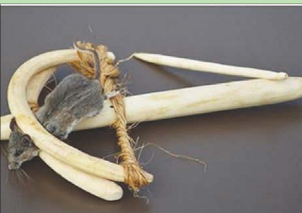
تصور لشكل المصيد المستخدمة في اصطياد الزبابة المقدسة

استخدمت في الصيد وتسببت في الكسور التي وُثقت. ويقول الباحثون في توصيفهم لحالة مومياء «الزبابة المقدسة»، إنها كانت تحتوي على الهيكل العظمي والأنسجة الرخوة، وكشفت الأشعة أن قاعدة الجمجمة كسرت كما كسر العظم الصخري الأيسر، وقطع حمادة العمود الفقري بين الفقرات الصدرية الأولى والثانية مما أدى إلى انسداد كامل للقناة الشوكية وانفصال الحبل الشوكي المحفوظ. ويضيف الباحثون: «كانت الأنسجة الرخوة في منطقة الظهر سمكية بشكل ملحوظ وتحتوي على منطقة ذات حدود غير منتظمة مليئة بالهواء، وذلك نتيجة لعملية التجفيف أثناء التحنيط».