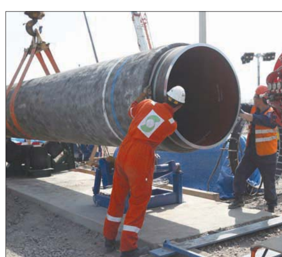
عمال في موقع تشييد لخط أنابيب «نورد ستريم 2» في منطقة لينينغراد الروسية

على خط الغاز «نورد ستريم 2» تعد من مظاهر المنافسة غير العادلة، وتعارض مع مبادئ التجارة الدولية والقانون الدولي، حسبما أفادت به وكالة «بلومبرغ» للأنباء. وأضاف بيسكوف أن روسيا ستبدل ما بوسعها للدفاع عن مصالحها ومصالح المشاريع التجارية الدولية. وسيضعاف «نورد ستريم 2» الشحنات الروسية من الغاز الطبيعي عبر طريق بحر البلطيق إلى ألمانيا، أكبر اقتصاد في أوروبا. ويقول معارضو خط الأنابيب، بما في ذلك الولايات المتحدة وبولندا وأوكرانيا، إن الخط سيمنح ديمتري بيسكوف، المتحدث باسم الرئاسة الروسية (الكرملين)، في مؤتمر عبر الهاتف، إن العقوبات المفروضة