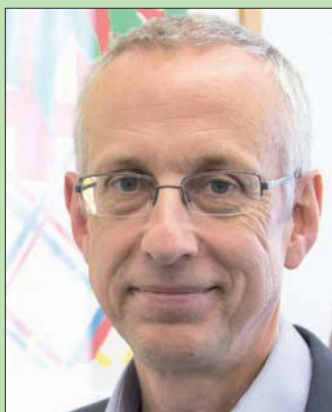
المبعوث البريطاني نيك داير

«دور السعودية هو دق ناقوس الخطر وإثارة الحجة (دولياً) إلى تخصيص المزيد من الموارد للاستجابة الإنسانية، وخاصة في اليمن».