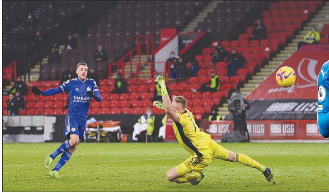
فاردي نجم ليستر يسجل في الوقت القاتل هدف فوز فريقه بمرسى شيفيلد يونائيتد

وبعد خوضه 404 مباريات في المستوى الأول، نجح بالاس في تسجيل 5 أهداف أو أكثر في المرة الأولى خارج قواعده. وبعد عودته إثر غياب مباراتين لإصابته بغيروس «كورونا» المستجد، ساهم العاجي ويلفريد زاهو بتسجيل الهدف الأول الذي ارتد من دارنيل فورلونغ داخل مرعى شبكاه مبعكراً في الدقيقة الثامنة. وعادال وست بروميتش بتسديدة أرضية من وسط المنطقة عبر كونيور غالاجر في الدقيقة 30. لكن سير المباراة انقلب رأساً على عقب بعد طرد لاعبه البرازيلي ماتيويس بيريرا في الدقيقة 34. واستعاد زاهو تقدم بالاس بتسديدة صاروخية رائعة في الزاوية اليسرى للحارس في الدقيقة 55، ثم عزز البلجيكي كريستيان بيتنكي تقدم بالاس براسية قريبة في الدقيقة 58. وفرض زاهو نفسه نجماً للمباراة