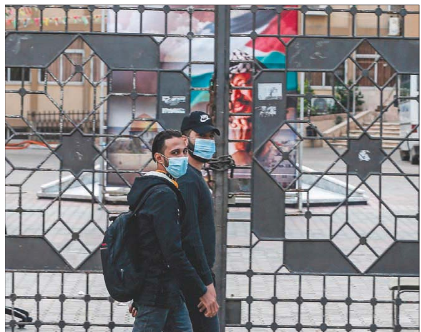
شابان يعبران جامعة الأزهر فرع غزة المغلقة بسبب تفشي جائحة كورونا (أفب)

لعسقلان، انتقد رئيس البلدية هناك، تومير غلام، الحكومة الإسرائيلية لتجاهلها المواقف على برنامج المساعدات الخاصة بالمدنية، كما وعدت بذلك منذ