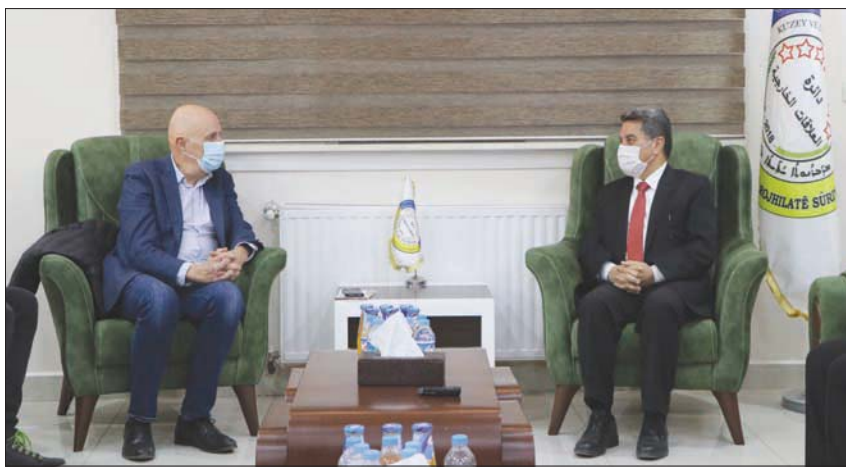
زيارة السيناتور جورج دالماني عضو البرلمان البلجيكي (يسار) إلى القامشلي

مقتل عدد من المولدين يعتقد أنهم عناصر من تنظيم «حراس الدين»، بينهم مقاتلون من جرسات عربية، بحسب المرصد السوري لحقوق الإنسان.