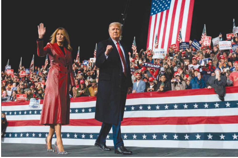
ترمب وميلانيا في نهاية تجمع انتخابي في فالديستا بولاية جورجيا مساء السبت