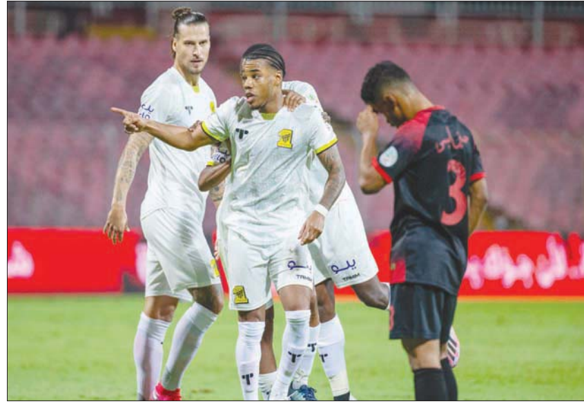
فرحة اتحادية بعد الهدف الأول

بصدارة لائحة ترتيب الدوري. ويدخل الفريق الأزرق هذه المباراة بنشوة معنوية كبيرة في ظل تحويجه مؤخراً ببطلونة «كاس الملك» بالإضافة لفوزه العريض أمام الفتح في الجولة الماضية. أما الفتح في الجولة الماضية، فسيستمر الغيابات في صفوف فريق الهلال، خصوصاً على صعيد حراسة المرمى. إلا أن الفريق الأزرق ظل حاضراً في قائمة أفضل الفرق الدفاعية؛ حيث لم تستقبل شبكاه