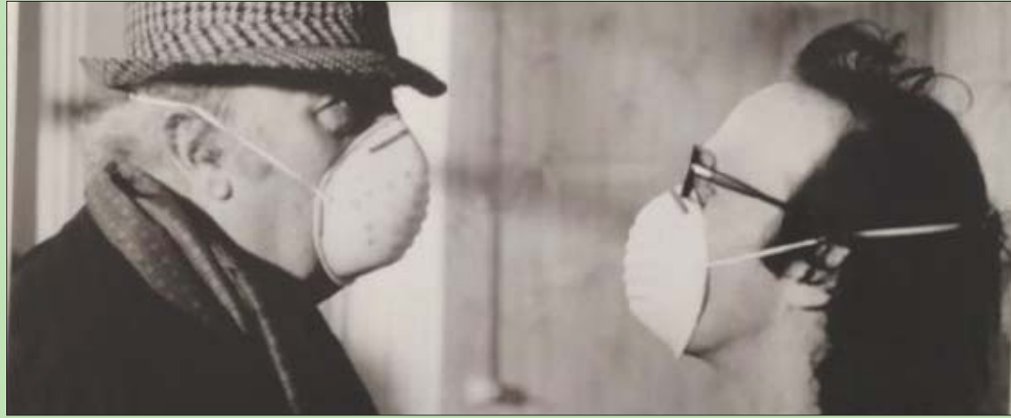
لقطة من فيلم للمخرج الإيطالي الراحل

الحبة صارت قبة، وكحادثاً مع مرور الأيام ستعود مجدداً لتصبح حبة، ثم نبدأ بعدها في البحث عن حبة أخرى، ننفخ فيها حتى تُصعب «قبة»!!