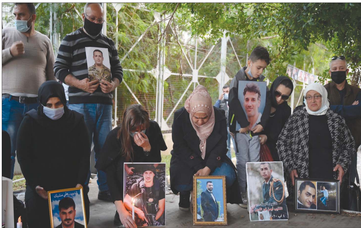
وقفة مجموعة من عائلات ضحايا انفجار مرفأ بيروت للمطالبة بتسريع التحقيقات