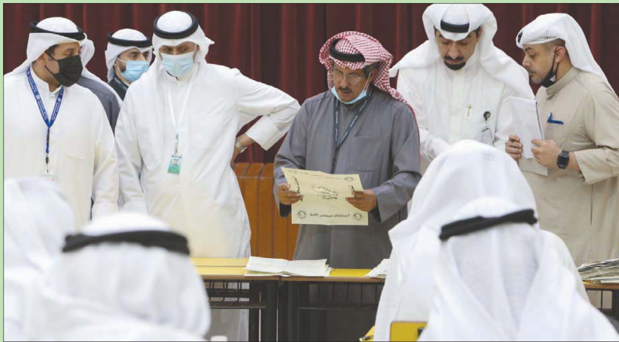
قاضي يعلن نتائج الانتخابات في دائرة عبد الله السالم بالكويت

لشؤون الإسكان ووزير الإعلام، ويقع على عاتق البرلمان الحالي مسؤولية إقرار التشريعات الكفيلة بالإصلاح الاقتصادي ومحاربة الفساد، في المرحلة الجديدة التي يقودها الأمير نواف الأحمد الجابر الصباح.