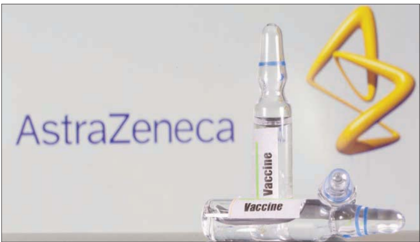
لقاح «أسترازينيكا» طوره الشركة بالتعاون مع جامعة أكسفورد

أفراد القوات المسلحة والأجهزة الأمنية سيتولون الإشراف على تطبيق هذه التدابير، كاشفاً عن أن قاعدة «براتيكا دي ماري» بحلول نهاية العام المقبل. إلى ذلك، وبعد الإعلان عن حزمة التدابير الصارمة التي وضعتها الحكومة الإيطالية خلال عطلة الأعياد المقبلة لاحتواء الوباء الذي يواصل سريانه بكثافة ويوقع أعداداً من الضحايا تجاوزت فترة الذروة خلال المرحلة الأولى في الربع الماضي، أعلن وزير الصحة وراقبه القوات المسلحة.