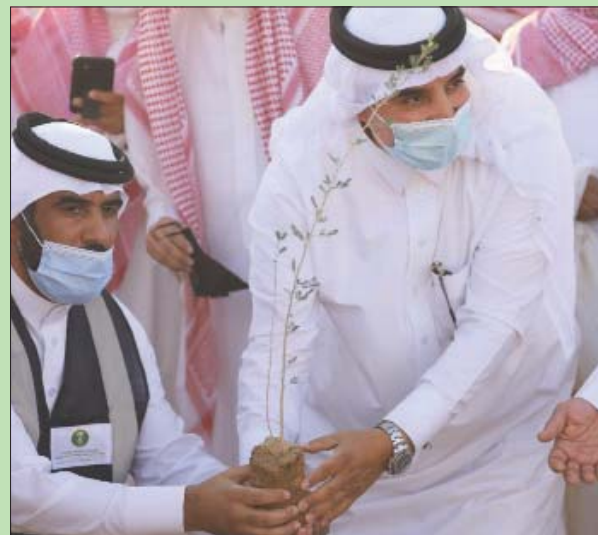
زراعة الأشجار ومكافحة التصحر ضمن خطة وطنية

وكانت موطناً للشاعر الأموي المشهور جرير بن عطية الخطفي التميمي، ونسبت له أشعار عذبا النقاد الأجل له سواء في المدح أو الوصف أو الرثاء، وكان من أجداده الشاعر المشهور عقيل بن بلال بن جرير، حيث استحضرت الحضور أثناء تدشين المشروع قصائد للشاعر وحظي باهتمام أجواء ماطرة وقرت المياه اللازمة لعمليات الغرس.