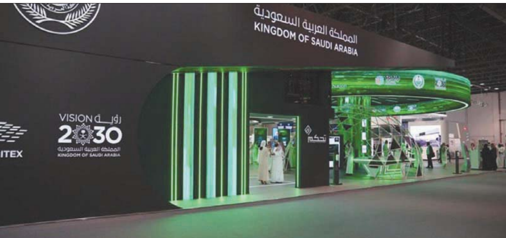
جناح وزارة الداخلية السعودية في معرض «جيتكس» 2020 بدبي (واس)

وأشار الربيعية إلى أن أزمة «كوفيد - 19» أظهرت مدى مكانة القوة التي تمتلكها المنظومة الرقمية لوزارة الداخلية، حيث كانت الخدمات استثنائية سواء في عمليات التطوير أو طرح المنتجات وتنفيذها على الميدان كالتطبيقات التي صدرت خلال الفترة، مؤكداً أن المنظومة وضعت البنية المناسبة لتقديم الخدمات للمتعاملين بما يتوافق مع متطلبات الوقاية من فيروس كورونا، وذلك بشكل سلس. وشدد وكيل وزارة الداخلية السعودية للقرارات الأمنية على أن منظومة «أبشر» تعد قلب الخدمات، وحقت نجاحاً كبيراً بعد أن استثمرت فيها الوزارة ولا تزال