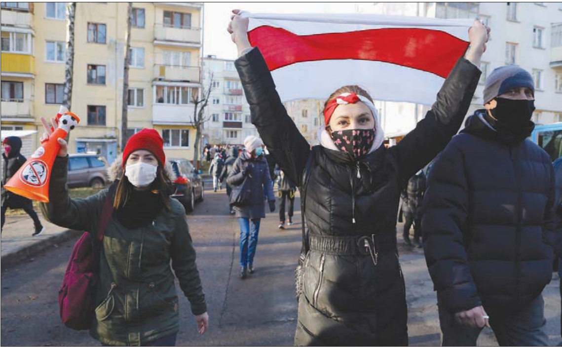
متظاهرون ضد رئيس بيلاروسيا في مينسك أمس

موسكو، «التشرق الأوسط»، احتشد آلاف المحتجين في مينسك، عاصمة بيلاروسيا، وأماكن أخرى، أمس (الأحد)، مع تواصل الاحتجاجات الأسبوعية للمطالبة بتسريح الرئيس المخضرم الكسندر لوكاشينكو، مما دفع الشرطة إلى اعتقال أكثر من مائة شخص.