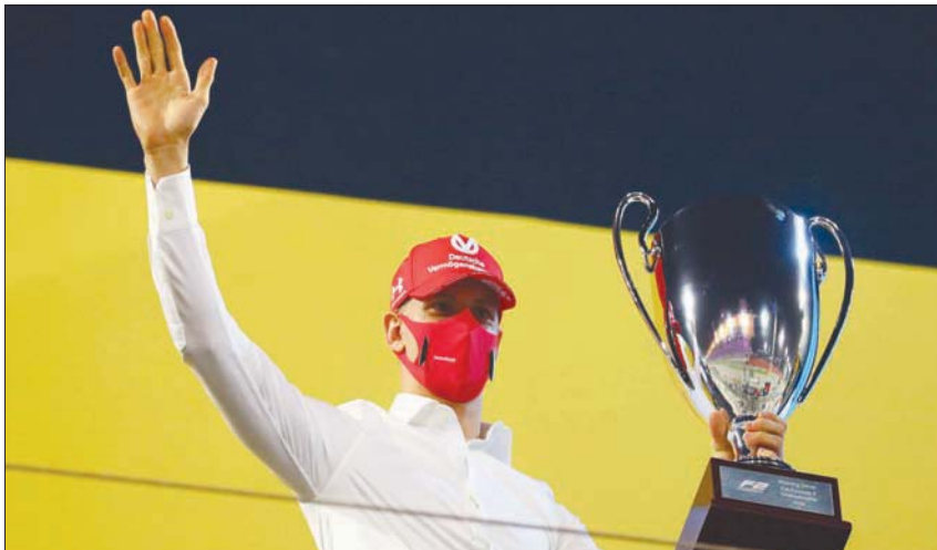
جانب من مراسم تتويج شوماخر في سباق الفورمولا 2 أمس

جبال الألب الفرنسية في 2013. ونال ميك شوماخر لقب «فورمولا 3» الأوروبية في 2018 وانضم إلى شارل لوكلير سائق «فبراير» وجورج راسل سائق ويليامز وهم فقط من نالوا لقب «فورمولا 2» قبل المشاركة في «فورمولا 1».