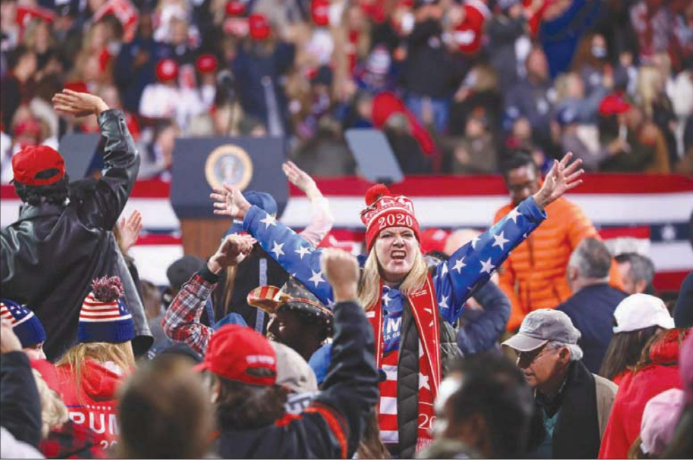
إحدى المشاركات في تجمع انتخابي لترمب مساء السبت في جورجيا