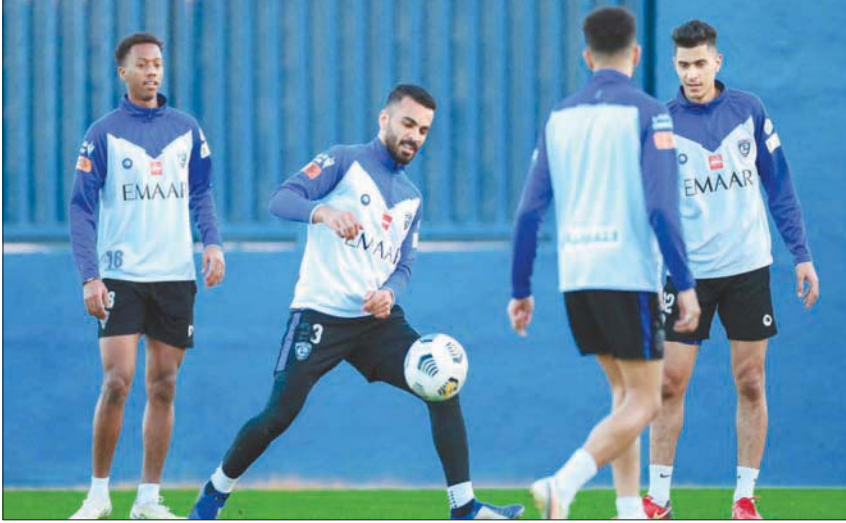
من تدريبات الهلال الأخيرة

واختتم فريق الهلال تحضيراته واستعداداته لمباراة نظيره الرائد بمناورة فنية على جزء من الملعب، شرح خلالها لوشيسكو النهج التكتيكي الذي سيعتمده في مباراة الرائد، وللتوقع من خلاله عودة كاريلو للقائمة الأساسية.