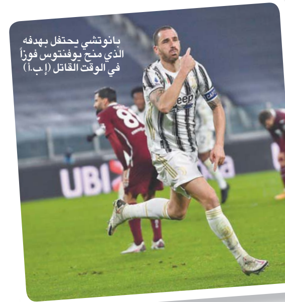
بانونتشي يحتفل بهدفه الذي منح يوفنتوس فوزاً في الوقت القاتل

لعبينا المباراة كما يجب أن نلعبها. الأمر يتعلق بكيفية العودة إلى الدفاع، وكيفية تغطية المساحات والتمرکز. فلما كل ذلك جيداً لكن أخطاء قليلة كلفتنا الكثير». على جانب آخر ضيق إتر ميلان الخناق على جاره ميلان المتصدر بانتصاره على ضيفه بولونيا 3 - 1 بفخضل هدف أول من البلجيكي روميلو لوكاكو الذي وجد طريقه إلى الشباك للمرة الثامنة في تسع مباريات خاضها هذا الموسم في الدوري، وثنائية للمغربي أشرف حكيمي، فيما كان هدف الضيوف الوحيد من نصيب البديل إيمانويل فينياتو.