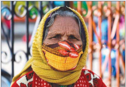
الهند تصارع للسيطرة على تفشي الوباء

نيودلهي - «الشرق الأوسط» قدمت شركة «فايزر» إنديا» (فرع الشركة في الهند) طلباً للهيئة الهندية للرقابة على الأدوية من أجل اعتماد الاستخدام الطارئ للقاحها ضد فيروس «كورونا». بعد أن حصلت الشركة الأم على موافقة على استخدام اللقاح من بريطانيا والبحرين، طبقاً لما ذكرته وكالة «بلومبرغ» للأنباء، أمس. نقلاً عن وكالة «بريس تراسيت أوف إنديا» الهندية للأنباء. وطلبت الشركة إنذاراً لاستيراد اللقاح لبيعته وتوزيعه في الهند، دون الحاجة إلى إجراء تجارب سريرية على السكان المحليين، طبقاً للبنود الخاصة، بموجب قواعد الأدوية والتجارب السريرية الجديدة لعام 2019، طبقاً لما ذكرته وكالة «بريس تراسيت أوف إنديا» الهندية للأنباء، نقلاً عن مسؤول لم يتم الكشف عن هويته. يُذكر أن شركة «فايزر» هي أول شركة أجنبية تسعى لاعتماد استخدام لقاحها في الهند، وقدمت الطلب في الرابع من الشهر الحالي، حسب التقرير.