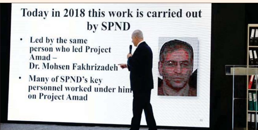
نتانياهو يشير إلى دور محسن فخري زاده في برنامج التسليح الإيراني أثناء عرض وثائق في أبريل 2018

نسية إلى عبد القدير خان مصمم المشروع النووي الباكستاني الذي زود إيران بدوائر الطرد المركزية لتخصيب اليورانيوم. وأضاف التقرير، أن زاده عمل حتى عام 2003 في مناصب بحثية وإدارية عليا، وخاصة في إطار «الوكالة الإيرانية للطاقة الذرية». ويعد الكشف عن مفاعل التخصيب في نطنز، غيرت إيران الاتجاه. وفي هذه المرحلة تم فصل المشروع النووي لأغراض