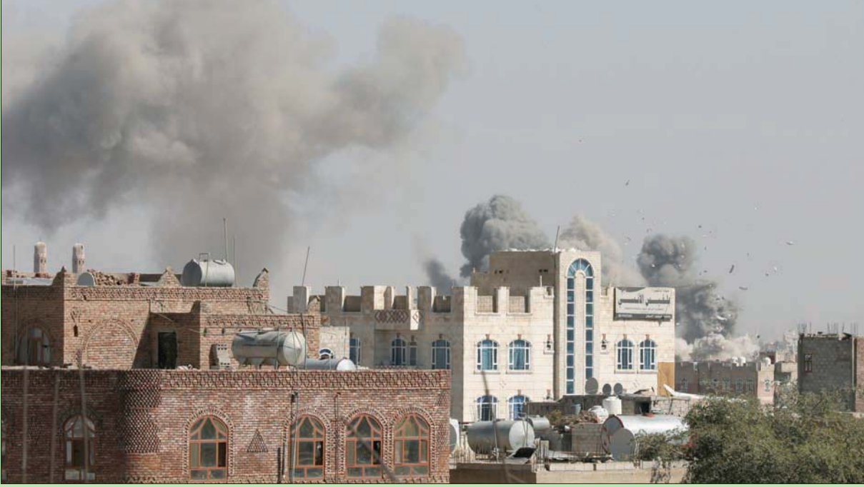
سحب الدخان تتصاعد من أحد المواقع التي استهدفتها التحالف في صنعاء أمس

الوية العملاقة في بيان (الجمعة)، أن المستشفيات والمراكز الطبية في المناطق المحررة بالساحل الغربي استقبلت منذ مطلع الشهر 27 مديناً؛ بينهم ثمانية أطفال ونساء، وأكد المصدر أن من بين الضحايا 11 مديناً قتلوا؛ بينهم طفلة وامرأة، بينما بلغ عدد الجنحى 16 مديناً من بينهم ثلاثة أطفال وثلاث نساء، وقد وصفت بعض الحالات المصابة بالخطيرة. وأوضحت المصادر أن الضحايا المدنيين سواء القتلى أو الجرحى سقطوا بفعل الأنغام والعبوات الناسفة وقذائف الهاون ورصاصة القنصاصة والعبوات الرشاشة في مديريات التحنات والخوخة والدرهمي ومنطقة الجاح التابعة لمديرية بيت الفقيه.