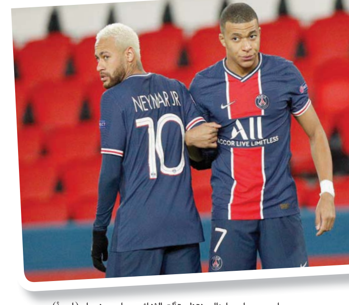
سان جيرمان ما زال ينتظر تألق الفئاني مبابي ونيمار

من غياب إبراهيموفيتش لتعزيز سجله التهديفي، بعد أن أحرز 8 في الدوري هذا الموسم، و29 في عام 2020، وهو في طريقه لتسجيل 30 هدفاً في الدوري خلال عام واحد للموسم التاسع في مسيرته.