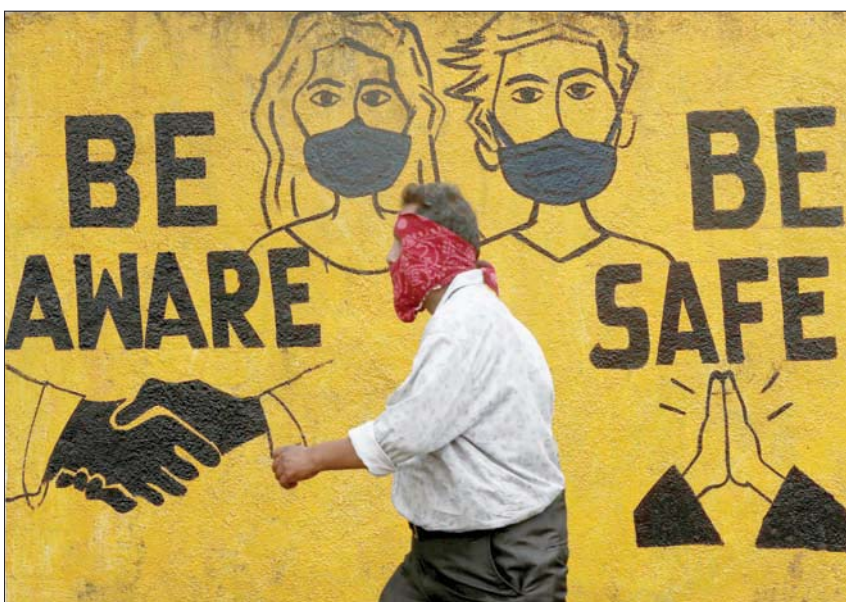
تسعى الهند إلى توعية السكان بمخاطر الوباء

الرعاية المركزة بأذى». وسجلت الهند 9,3 مليون إصابة بالمرض وهو ثاني أعلى عدد إصابات على مستوى العالم بعد الولايات المتحدة فيما تجاوزت حصيلة الوفيات 135 ألفاً. وقالت وزارة الصحة أمس (الجمعة) إنها رصدت 43082 إصابة و492 وفاة جديدة في الأربع والعشرين ساعة الماضية. وتسجيل 54 حالة وفاة خلال الساعات الـ 24 الماضية، بسبب فيروس كورونا المستجد، لترتفع حصيلة الوفيات في أنحاء البلاد جراء الفيروس إلى 7897 حتى أمس. وأعلن المركز الوطني للقيادة والعمليات في أحدث أرقام له عن عدد المصابين، تسجيل 3113 حالة إصابة جديدة خلال الساعات الـ 24 الماضية، لترتفع حصيلة المصابين إلى 389 ألفاً و311، حسبما ذكرت صحيفة «ذا نيشن» الباكستانية أمس. وما زال إقليم السند الأكثر تضرراً من الوباء. وأجرت باكستان حتى الآن خمسة ملايين و386 ألفاً و916 اختباراً للكشف عن فيروس كورونا، و43 ألفاً و214 في الساعات الـ 24 الماضية.