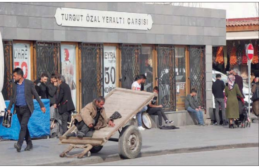
بيدو الاقتصاد التركي محاصراً لأن العودة إلى سياسات اقتصادية تحترم قواعد السوق الحرة قد تعني المزيد من تذبذب سعر الليرة

المؤسسات الأجنبية بما يصل إلى 5 في المائة من إجمالي تعاملاتهم التي تنم خلال سبعة أيام. وزاد الحد الأقصى إلى 10 في المائة بالنسبة للتعاملات التي تتم خلال شهر، و30 في المائة للتعاملات التي تتم خلال عام.