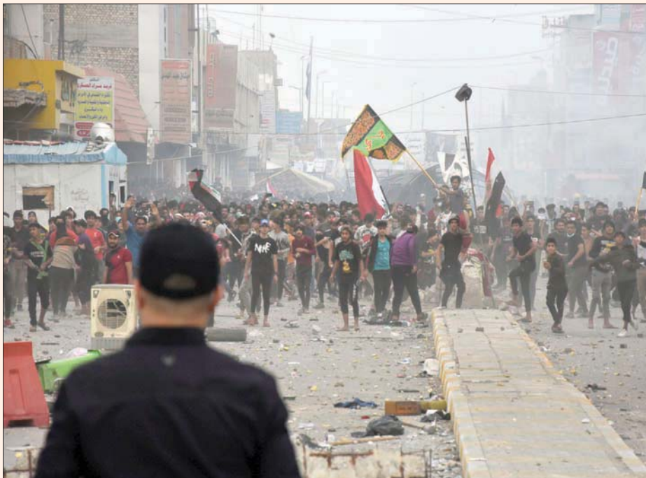
جانب من المواجهات بين ناشطين وأنصار التيار الصدري في الناصرية أمس (رويترز)

وقال الصدر، الذي يحظى بشعبية واسعة وطاعة كاملة من قبل أنصاره، في تغريدة له، «إن بقيت وبقيت الحياة، ساتابع الأحداث عن كثب وبدقة، فإن وجدت أن الانتخابات ستسفر عن أغلبية (صدرية) في مجلس النواب، وأنهم سيحصلون على رئاسة الوزراء، وبالتالي سأتتمكن بعمودتكم، وكما تعاهدنا سوية، من إكمال مشروع الإصلاح من الداخل، سأقرر خوضكم الانتخابات، فالسبب الذي أدى إلى قسمني بعدم خوض الانتخابات سيرول وأكون في حل من قسمي».