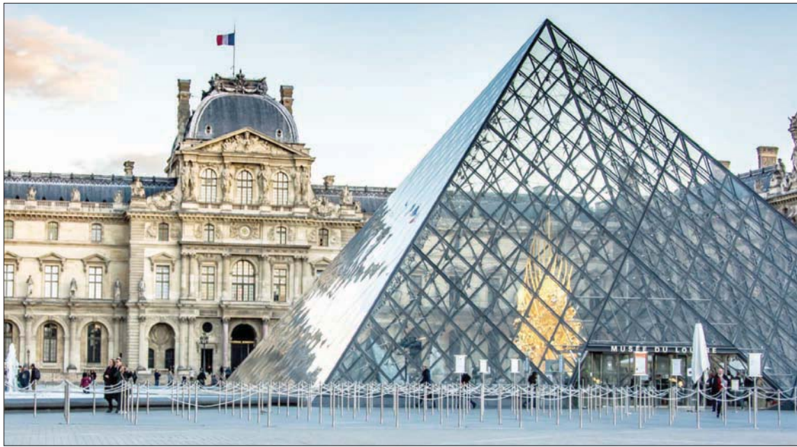
اللوفر في زمن «كورونا»

ومن ضمن النشاطات فعالية بعنوان: «زايد من أجل اللوفر». وكما يشير اسمها، فإنها مزاد علني يجري منتصف الشهر المقبل بالتعاون مع داري «دروو» للمزادات في باريس و«كريستيز»، عبر الفضاء الإلكتروني.