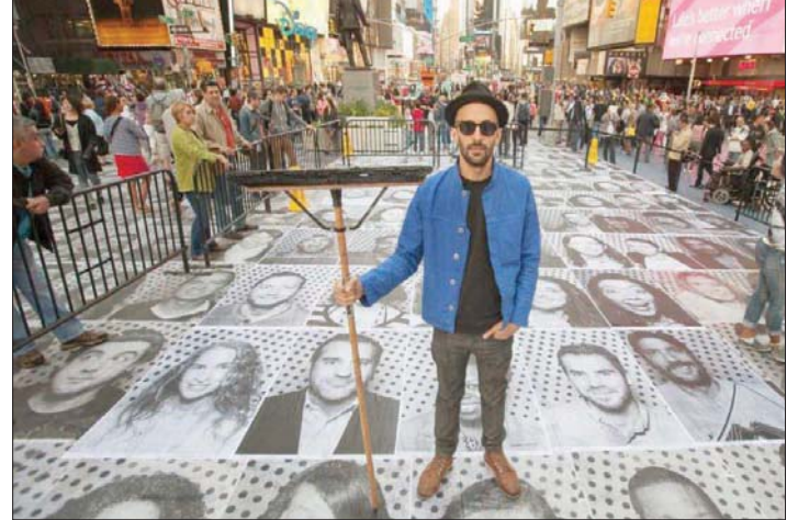
الفنان جي آر

ويتضمن المزاد مجموعة من الأعمال التي تبرع بها فنانون معروفون، ومنها لوحة للرسام بيير سولاج تعود لسنة 1962، ويتراوح تقدير ثمنها بين 800 ألف و مليون ومائتي ألف يورو. وبلغ سولاج، الملقب بعاشق اللون الأسود، المائة من العمر هذا العام، وهو يعد عميد الفنانين الأحياء في فرنسا.