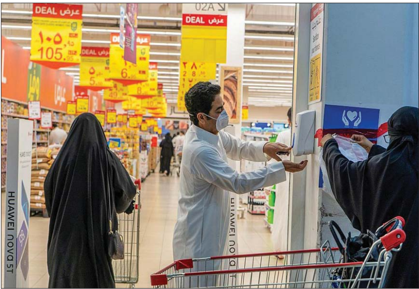
الالتزام بالاجراءات الاحترازية ساهم في تقليص اعداد الاصابات والوفيات

الفيروس ليصل العدد الإجمالي للحالات المتعافية إلى 84 ألفاً و510 حالات، بينما تم رصد حالة وفاة واحدة خلال الساعات الماضية ليصبح إجمالي الوفيات في البلاد 341 حالة. وأوضحت الوزارة البحرينية أن عدد الحالات القائمة تحت العناية بلغ 12 حالة، والحالات التي يتطلب وضعها الصحي تلقي العلاج بلغت 29 حالة، في حين أن 1484 حالة وضعها مستقر من العدد الإجمالي للحالات القائمة الذي بلغ 1496 حالة قائمة.