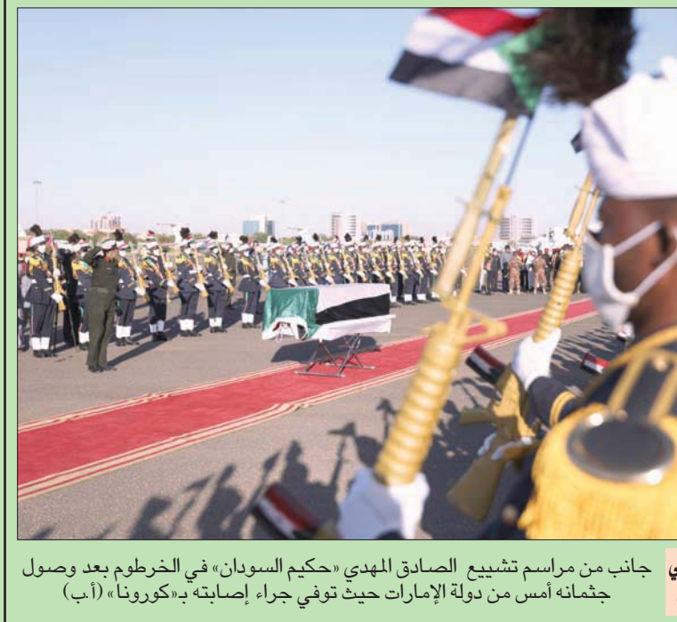
توديع رسمي وشعبي لجانب من مراسم تشييع الصادق المهدي «حكيم السودان» في الخرطوم بعد وصول جثمانه أمس من دولة الإمارات حيث توفي جراء إصابته بـ«كورونا»

لندن، الشرق الأوسط، ونقلت مجلة «در شبيغل» ومجلة «دويتشه فيله» الألمانية ملخصاً لتأخرات التحقيق على موقعها على الإنترنت. واستندت التحقيقات إلى شهادات ناجين من الهجوم، وتعمل وحدة التحقيق في الجرائم بموجب قانون ألماني أقر عام 2002 ويتيح للمانيا حق «الولاية القضائية» بشأن جرائم الحرب في العالم، ومن بينها استخدام الغاز الكيماوي، كما حصل في الغوطة. ووفقاً للوثائق التي حصل عليها التحقيق فإن ماهر الأسد هو الذي «عطى الأمر الرسمي»، ووصفه التحقيق بأنه «ثاني أقوى شخص في سوريا» وكان «القائد العسكري الذي أمر مباشرة باستخدام غاز السارين في الهجوم على الغوطة»، بعدما «فوضه» شقيقه الرئيس بشار الأسد بذلك. ويذكر التحقيق الألماني أن ذلك الهجوم لم يكن نادراً أو عشوائياً، بل يدخل «في إطار استراتيجية حرب متعددة». يذكر أن روسيا والصين سبقا أن صوتتا بالفيديو ضد قرار مجلس الأمن بإحالة هجوم الغوطة إلى المحكمة الجنائية الدولية. وحصلت ضغوط على النظام السوري آنذاك للتخلص من أسلحته الكيماوية. لكن التحقيق الألماني يؤكد أن النظام لم يحترم تعهدهاته بهذا الشأن. وقد أنكر باستمرار مسؤوليته عن هجوم الغوطة. ورفضت السفارة السورية في برلين الرد على طلب المحققين الألمان التعليق على النتائج والمسؤوليات التي توصلوا إليها. (تفاصيل ص 6)