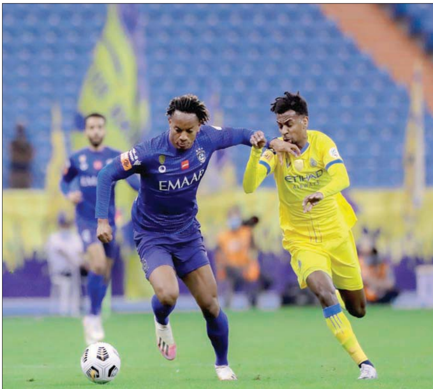
قطبا العاصمة التقيا في أربعة نهائيات على كأس البطولة وكسب كل منهما مرتين

ليغيب النصر عن لقب البطولة بعد عودتها بشكلها الجديد رغم بلوغه المباراة النهائية ثلاث مرات، كانت الأولى في 2012 و خسرها 1-4، ثم أمام الهلال في 2015 وخسرها عن طريق ركلات الترجيح، قبل أن يعود لمواجهة الأهلي مجدداً في 2016 ويخسر بهدفين لهدف.