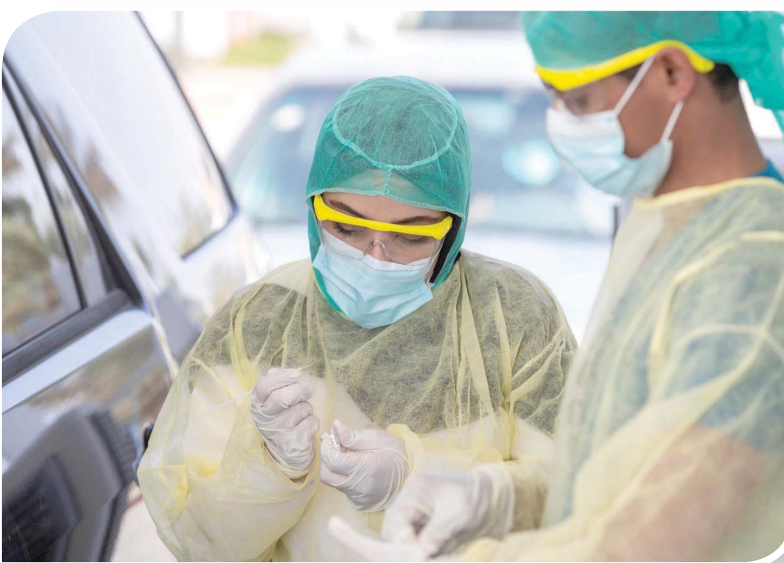
رئاسة السعودية لـ«العشرين» وضعت محور «الإنسان أولاً» بالتركيز على أجندة الرعاية والصحة في كافة الموضوعات

في يونيو (حزيران) الماضي، تعهدت دول مجموعة العشرين بضيخ مليارات الدولارات لمكافحة الجائحة طوال العام، حيث قالت المجموعة حينها: «إن مجموعة العشرين والدول المدعوة قادت الجهود العالمية لدعم مكافحة جائحة فيروس كورونا التي نتج عنها حتى اليوم تعهدات بأكثر من 21 مليار دولار، لدعم تمويل الصحة العالمية». وكانت السعودية، رئيسة المجموعة، قدمت 500 مليون دولار لدعم الجهود العالمية لمكافحة الجائحة، حيث خصصت 150 مليون دولار لتحالف ابتكارات التأهب الوبائي (CEPI)، و150 مليون دولار للتحالف العالمي للقاحات والتحصين (GAVI)، و200 مليون دولار للمنظمات