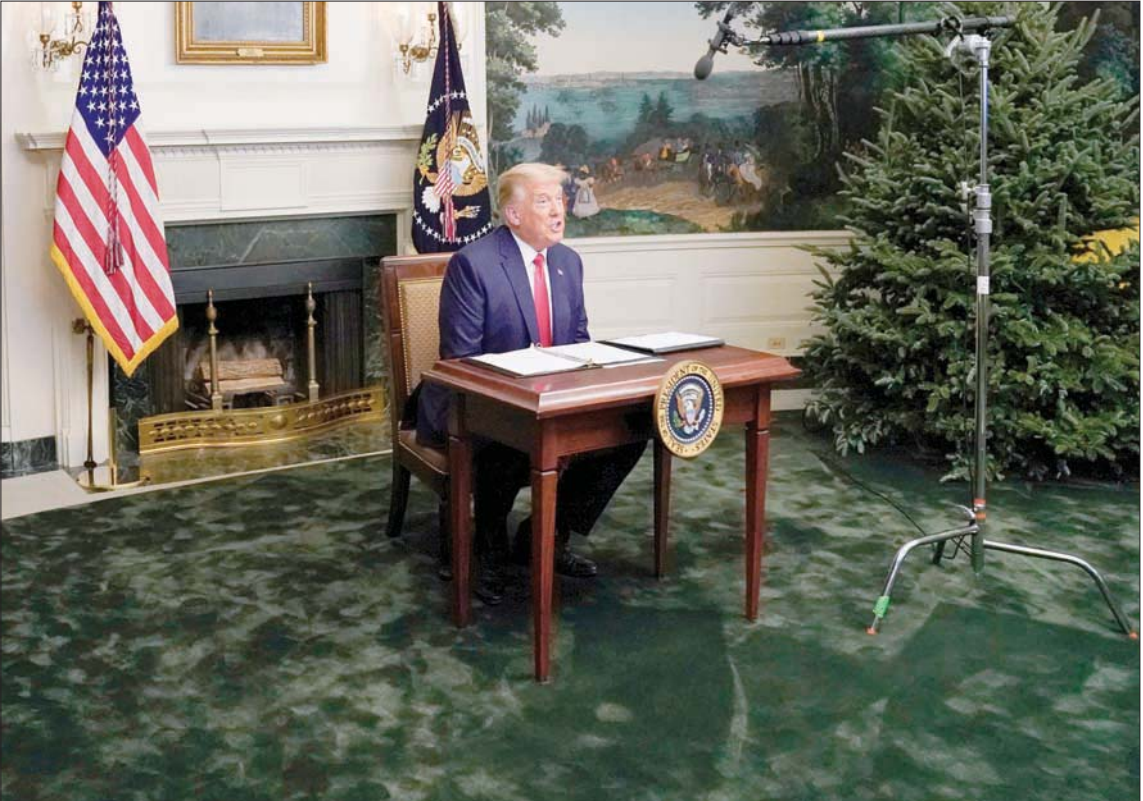
الرئيس الأمريكي أثناء حديثه للصحافيين في عيد الشكر يوم الخميس

أعلن دونالد ترمب، الخميس، لأول مرة أنه سيخرج من البيت الأبيض في حال تصويت الهيئة الناخبة لصالح خصمه الديمقراطي جو بايدن، في خطوة إضافية نحو الإقرار بهزيمته.