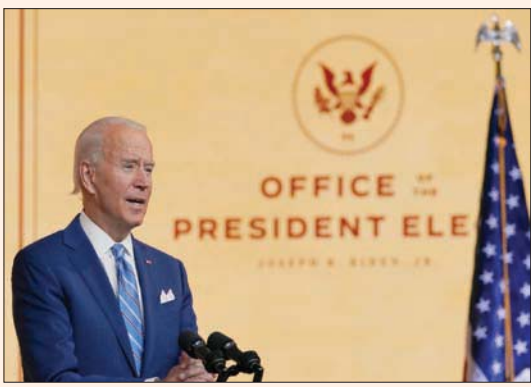
بايدن عقد مؤتمراً صحافياً في ويلمينغتون الأربعاء (آب)

استمرار لسنوات أوباما. فيما يتعلق بأزمة «كوفيد-19» التي أعادت البلاد نحو حافة الإغلاق، قال بايدن إن فريقه يرتب للقاء مسؤولي البيت الأبيض الذين يتعاملون مع الوباء. ومن القضايا التي يخططون لمعالجتها «كيفية ليس فقط توزيع اللقاح، ولكن الانتقال من اللقاح الذي يتم توزيعه إلى الشخص الذي يمكن الحصول على اللقاح».