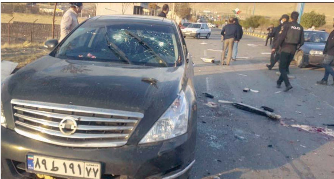
سيارة مسؤول الأبحاث في وزارة الدفاع الإيرانية بعد الهجوم الذي أودى بحياته في ضواحي طهران أمس