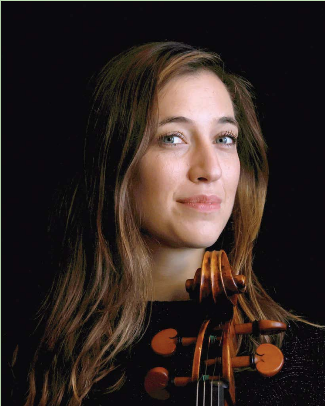
عازفة التشيلو الفرنسية اليلجيكية كاميل توماس خلال مقابلة مع «رويترز» في متحف الفنون الزخرفية الذي أُلغى أمام الزوار في باريس بسبب «كورونا»