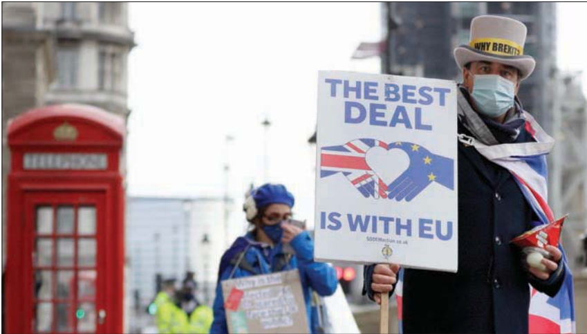
الخلاف بين الجانبين في مسألة الانفصال قد يضر بشدة الخدمات المالية

الوزراء البريطانيون بوريس جونسون، في الوقت الذي هدد فيه كبير مفاوضيه، ميشال بارنييه، بوقف المحادثات. وقالت رئيسة المفوضية إن الكتلة يجب أن تكون «مبدعة» فيما يتعلق بالنقاط الشائكة لحقوق الصيد والمعايير المشتركة. لكن مصادر بروكسل قالت إن بارنييه أبلغ نظيره البريطاني، اللورد فروست، أن فريق الاتحاد الأوروبي سيسافر إلى لندن لإجراء مفاوضات فقط إذا شعر بأنه يمكن تحقيق انفراجة في نهاية هذا الأسبوع. وقبل إن بارنييه أصيب بالإحباط من المحادثات «غير المجدية»، حيث رفض اللورد فروست مطالب الاتحاد الأوروبي. وقال مصدر في الاتحاد الأوروبي: «البريطانيون يضحكون علينا بصراحة؛ الوقت قصير للغاية. إذ إننا ننتقل من نوازل بالتوقف عن المفاوضات، والذهاب نحو عدم الاتفاق».