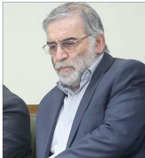
العالم الإيراني محسن فخري زاده 2019