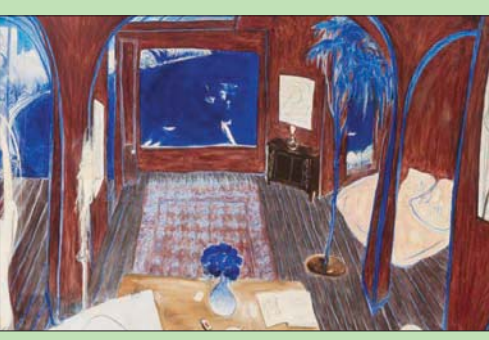
لوحة الفنان برييت وايتلي