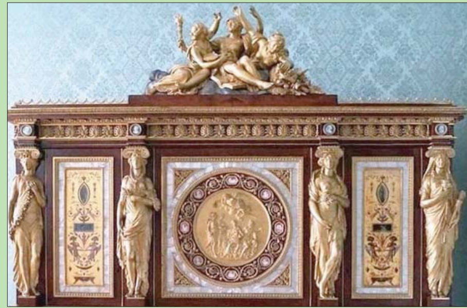
الماركترية اليدوي فن عريق ومنتشر بين العائلات المحبة للتراث