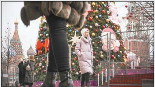
موسكو تستعد لأعياد الميلاد وتخشى تفشي الوباء.

موسكو - «الشرق الأوسط» قال وزير الدفاع الروسي سيرغي شويغو أمس، إن البلاد تعتزم تطعيم أكثر من 400 ألف عسكري ضد «كوفيد - 19»، فيما أبلغت السلطات عن تسجيل مستوى قياسي للإصابات اليومية بفيروس «كورونا» بلغ 27543 إصابة جديدة. وتشهد روسيا، التي تعمل على تطوير عدة لقاحات مضادة لـ «كورونا»، ارتفاعاً في الإصابات منذ سبتمبر (أيلول)، لكن السلطات ما فتئت فرض إجراءات عزل عام ولجأت بدلاً من ذلك إلى تدابير في مناطق معينة. وذكر معهد فيكتور في سيبيريا، الذي يعكف على تطوير لقاح «إبي فاك كورونا»، وهو لقاح روسي ثان، أن الماعة التي سيوفرها اللقاح لن تستمر مدى الحياة وأن تلقي جرعات إضافية سيكون ضرورياً خلال سنة إلى عشرة أشهر من أول جرعتين ثم مرة كل ثلاث سنوات. وقال الكسندر ريجنكوف، رئيس قسم الأمراض الحيوانية المنشأ والإنفلونزا بالمعهد، أمس، إن المعهد مستعد لإنتاج ما يصل إلى خمسة ملايين جرعة من اللقاح سنوياً.