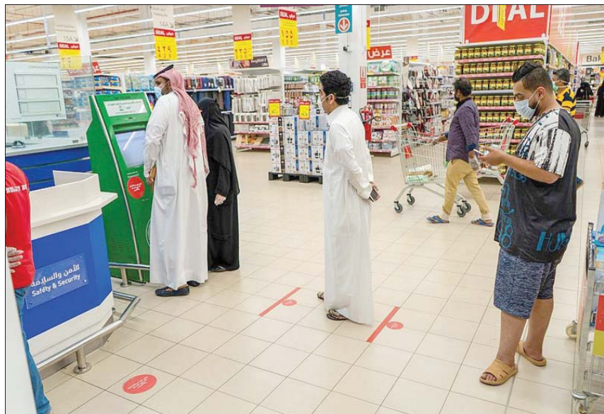
الالتزام بالاجراءات الاحترازية ساهم في تقليص اعداد الاصابات والوفيات