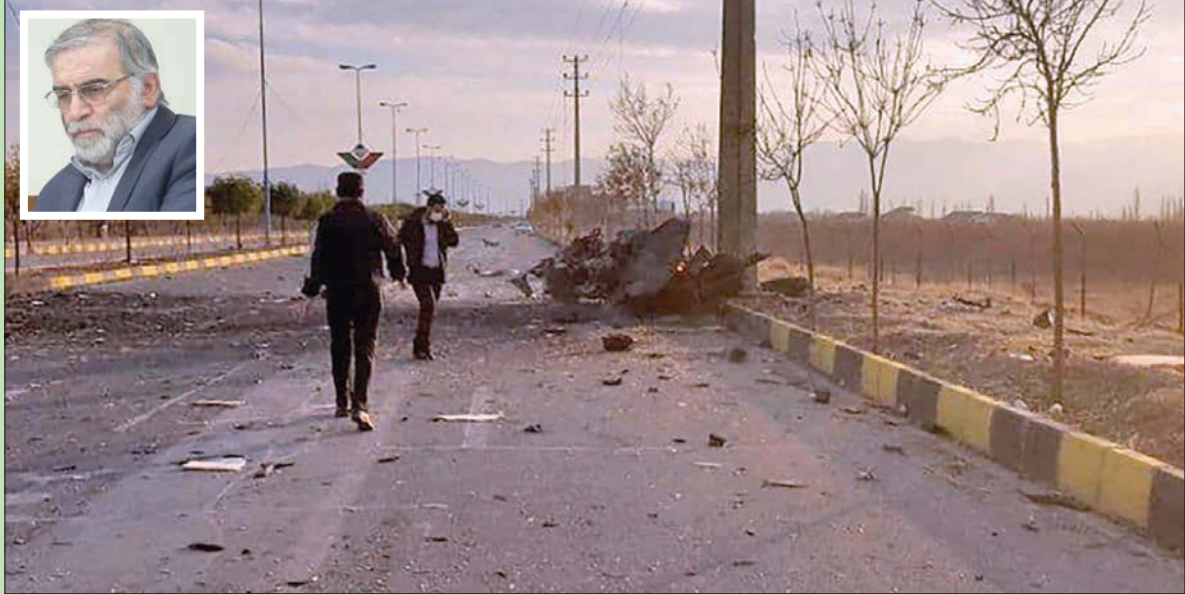
لندن - طهران، الشرق الأوسط، قتل أبيب، نظير مجلي

أعلنت إيران، أمس، اغتيال عالمها النووي محسن فخري زاده، الذي يوصف بأنه «الصدوق الأسود» للبرنامج التسليح النووي الإيراني، في كمين قرب طهران التي سارعت إلى توجيه الاتهام إلى إسرائيل وهددتها بـ«انتقام قاس». وقالت وزارة الدفاع الإيرانية في بيان إن هجوماً استهدف رئيس منظمة البحث والتطوير التابعة لها محسن فخري زاده، ما أدى إلى وفاته بعد إصابته «بجروح خطيرة» على يد من وصفتهم بـ«عناصر إرهابية»، وأوضحته وكالة «تسنيم» و«فارس» التابعتان لـ«الحرس الثوري» أن عملية الاغتيال جرت في بلدة أسرد قرب مدينة دماوند الواقعة شرق طهران. وتحدثت عن «تفجير» قبل «إطلاق النار على سيارة» فخري زاده، وورد أن ثلاثة إلى أربعة أشخاص آخرين قتلوا في تبادل لإطلاق النار. وكتب وزير الخارجية الإيراني محمد جواد ظريف عبر حسابه على «تويتر»: «قتل إرهابيون عالماً بارزاً اليوم. هذا العمل الجبان - مع مؤشرات جديدة لدور إسرائيلي - يظهر نيات عدوانية يائسة لدى المتفذين». وقدما لم تعلق إسرائيل رسمياً فإن رئيس الوزراء بنيامين نتانياهو، سارع للظهور في شريط مصور من بيته حال كشف اغتيال فخري زاده، فقال: «لا أستطيع الإعلان عن كل إنجازاتي هذا الأسبوع، لكنها كثيرة». بدوره، كتب قائد «الحرس الثوري» حسين سلامي في موقعه على «تويتر»: «من المؤكد، سيعاقب مرتكبو هذه الجريمة الكبرى»، ونقل عنه وسائل إعلام إيرانية لاحقاً أن «قراراً اتخذ للانتقام القاسي ومعاقبتهم». ونقلت صحيفة «نيويورك تايمز» عن مسؤول أميركي مع اثنين من مسؤولي المخابرات أن «إسرائيل كانت وراء الهجوم على العالم»، ولم يتضح ما إذا كانت الولايات المتحدة على علم بالعملية مسبقاً. (تفاصيل ص 3)