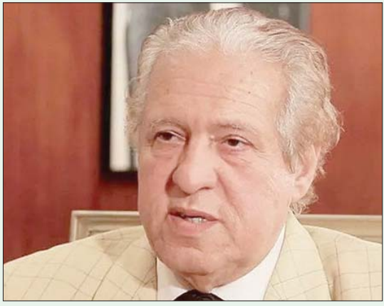
الفنان محمود الإدريسي