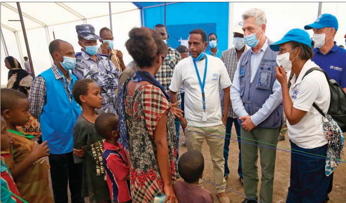
مفوض اللاجئين في الأمم المتحدة فيليبو غراندي مع نازحين من تيغراي لجأوا إلى شرق السودان

أهالي ميكي بالمعملية من خلال نشر طائرات هليكوبتر عسكرية وإلقاء منشورات... حتى يتسنى لهم حماية أنفسهم». وقال كينيث روث المدير التنفيذي لمنظمة هيومن رايتس ووتش إن هذه الجهود ليست كافية لحماية المدنيين. وأضاف في تغريدة على «تويتر»: «مع تراكم الأدلة على أعمال وحشية يرتكبها الجانبان في إقليم تيغراي الإثيوبي من الضوروي إرسال محققين دوليين الآن». ويقول محققون معنيون بحقوق الإنسان ومدنيون فروا من الصراع إن المقاتلين من الجانبين بما في ذلك ميليشيات مدنية تدعم قوات الأمن الرسمية نفذوا عمليات قتل جماعي. وتنفسي كل من الحكومة والجبهة الشعبية ضلوع قواتها في مثل هذه الأعمال.