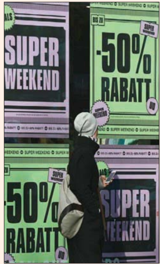
بروكسل، «الشرق الأوسط»

تراجعت المعنويات الاقتصادية في منطقة اليورو في نوفمبر (تشرين الثاني) للمرة الأولى في سبعة أشهر، إذ ضربت العقارة الأوروبية موجة ثانية من فيروس «كورونا»، مما أثر على المعنويات في جميع القطاعات، لا سيما تلك الأكثر تضرراً من إجراءات الإغلاق مثل الخدمات والتجزئة. وأظهر المسح الشهري للمفوضية الأوروبية أن المعنويات في الدول التسعة عشرة التي تستخدم العملة الأوروبية الموحدة نزلت إلى 87,6 نقطة من 91,1 في أكتوبر (تشرين الأول)، وهو أعلى قليلاً من توقعات السوق لتراجع إلى 86,5 نقطة.