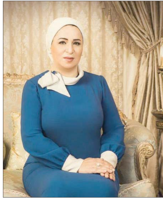
انتصار السيسي زوجة الرئيس

وترجع الدكتورة ليلي عبد المجيد، عميدة كلية الإعلام سابقاً بجامعة القاهرة، سبب الاهتمام المصريين بحوار «السيدة الأولى» إلى تمتع «الشعب المصري بعواطف إنسانية لافتة، تقوده إلى حب التعرف على تفاصيل الحياة الشخصية لرئيس الجمهورية الذي يحكمهم، لا سيما أنها تظهر لأول مرة في حوار تلفزيوني خاص، بعد مرات من ظهورها الخافت في مناسبات عدة برفقة الرئيس». وتحدثت السيدة انتصار السيسي عن تفاصيل نشأتها بميدان الجيش (وسط القاهرة)، المنطقة القريبة من مسقط رأس الرئيس (الجمايلية)، موضحة أن «هذين الحين يتميزان بالحب