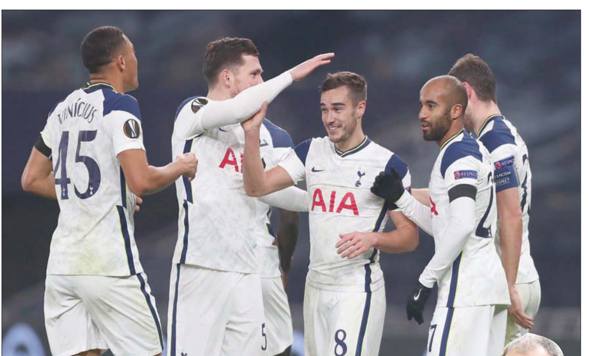
لاعبو توتنهام جاهزون لمواجهة تشيلسي بعد انتصارهم الكبير على ليدز يونايتد في الدوري الأوروبي

ويحل يوفنتوس (حامل اللقب في المواسم التسعة الأخيرة ضيفاً على بينيفينتو الصاعد هذا الموسم إلى دوري الأبطال، بعد أن حجز مقعده إلى دور ثمن النهائي من دوري الأبطال، إثر فوزه على فرينسفاوروك المجرى (2- صفر) الثلاثاء، إلا أن نادي فريق «السيدة العجوز» لا يقدم مستويات مقنعة خارج أرضه مقابل 3 تعادلات في الدوري. لكن لاعبي المدرب أندريا بيرلو عادوا إلى سكة الانتصارات الأسبوع الماضي، بفوزهم على كالياري (2- صفر). ويتطلع البرتغالي كريستيانو رونالدو للاستفادة