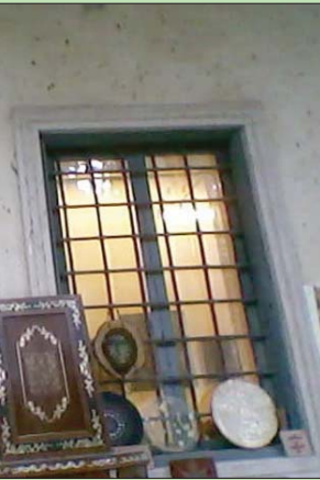
الماركترية عبارة عن فن زخرفة الأخشاب برسومات ملونة