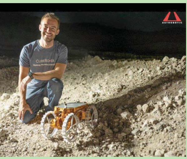
مركبة بحجم صندوق أحذية

سياتل - لندن: «الشرق الأوسط» لا يمكن للمرء أن يرى مركبة استكشاف قمرية مركبة أنيقة، لأنها ببساطة تزن مئات الأطنان، ومزودة بانواح شمسية وأجهزة استشعار وكاميرات وأذرع روبوتية عديدة، وتحمل سخانات ثقيلة تعمل بالطاقة النووية لمساعدتها على البقاء طيلة الليالي القمرية التي تستمر 14 يوماً. ولكن الآن هناك طرز جديدة من مركبات «لاند روفر» في طريقها