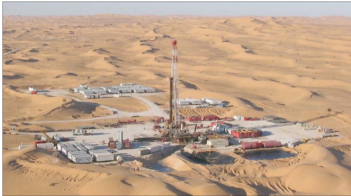
استهلاك الغاز في دول الخليج يعد الأعلى عالمياً