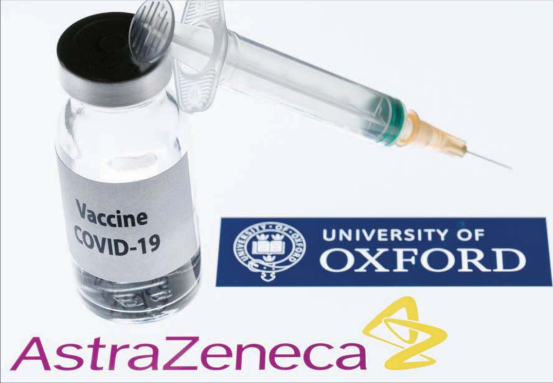
اللقاح الذي تطوره شركة «أسترا زينيك» بالتعاون مع جامعة أكسفورد

التحلي بالصبر حتى يتم إصدار البيانات الكاملة. ورغم أن لقاح «أسترا زينيك» ما زال في الوقت الحالي غير حاسم مقارنة بلقاحي شركتي «فايزر» و«موديرنا» الأميركيةتين، فإنه يتمتع بميزة استخدام تقنية تقليدية تجعله أقل تكلفة وأسهل في التخزين والنقل، بينما يحتاج اللقاحان الآخران لتخزينهما درجات حرارة منخفضة للغاية. وقالت «أسترا زينيك»، إنها تتقدم بسرعة في تصنيع 3 مليارات جرعة ستكون متاحة في عام 2021. وللمقارنة، أعلنت «فايزر» عن تصنيع 1.3 مليار جرعة بنهاية 2021. من جهة أخرى، أفادت وكالات الاستخبارات في سيول، أمس الجمعة، بأن الأبحاث المتعلقة بإنتاج لقاح ضد فيروس كورونا المستجد في مختبرات كوريا الجنوبية أصبحت هدفاً منتظماً للقراصنة الكوريين الشماليين. وقال نواب البرلمان الذين أطلعهم على ذلك جهاز الاستخبارات، إن الهجمات لم تنجح حتى الآن. ونقلت وكالة الأنباء الكورية الجنوبية «يونهاب» عن ها تاي كيونغ، عضو لجنة الاستخبارات، قوله إن جهاز الاستخبارات لم يخبرهم بهوية وكالات البحث المستهدفة. وقالت منظمة الصحة العالمية لوكالة الصحافة الفرنسية، إنها «تتخطى بفرار الصبر أن يتم نشر بيانات (أكسفورد/ أسترا زينيك) بالكامل. لأنها ستتيح لنا مراجعة البيانات التفصيلية وفهم أداء اللقاح بشكل أفضل». وفي هذا الإطار، حذّر كبير المسؤولين الطبيين في إنجلترا كريس وينبي، في مؤتمر صحافي، من الاستنتاجات المبكرة، داعياً إلى