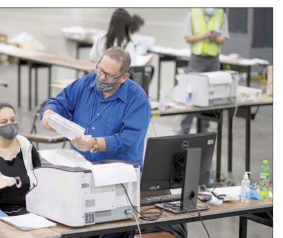
جانب من عملية إعادة فرز الأصوات في جورجيا الأربعاء (آب)

وبعد أن صادق وزير خارجية جورجيا وحاكمها الجمهوريان على نتيجة اقتراع الولاية لصالح بايدن، قالت دوللي إن مؤيدي الرئيس «يشككون في سبب دعمهم للمرشحين الذين لا يؤيدون ترمب بشكل كامل».