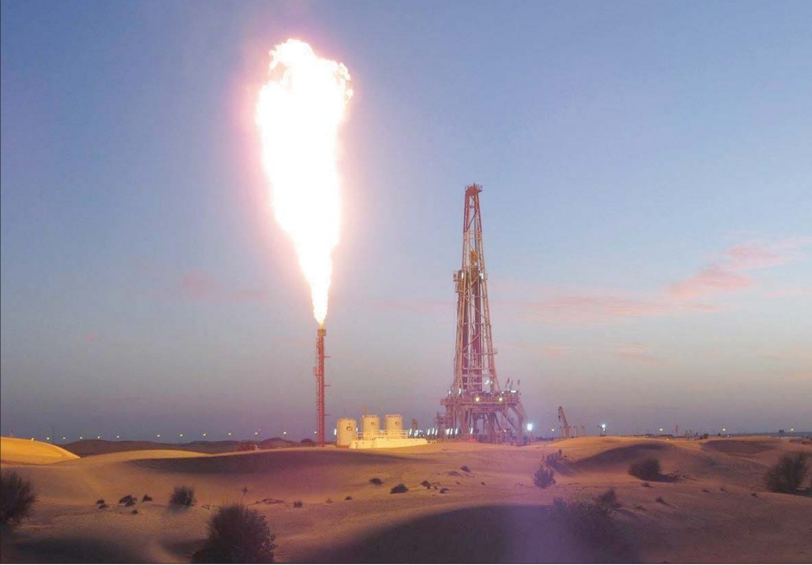
منهج الاقتصاد الكربوني الدائري لقي ترحيباً لتبنيه في قمة قادة مجموعة العشرين برئاسة السعودية (الشرق الأوسط)

الاقتصاد الدائري الكربوني فكرة خرجت من العاصمة الرياض للعالم،