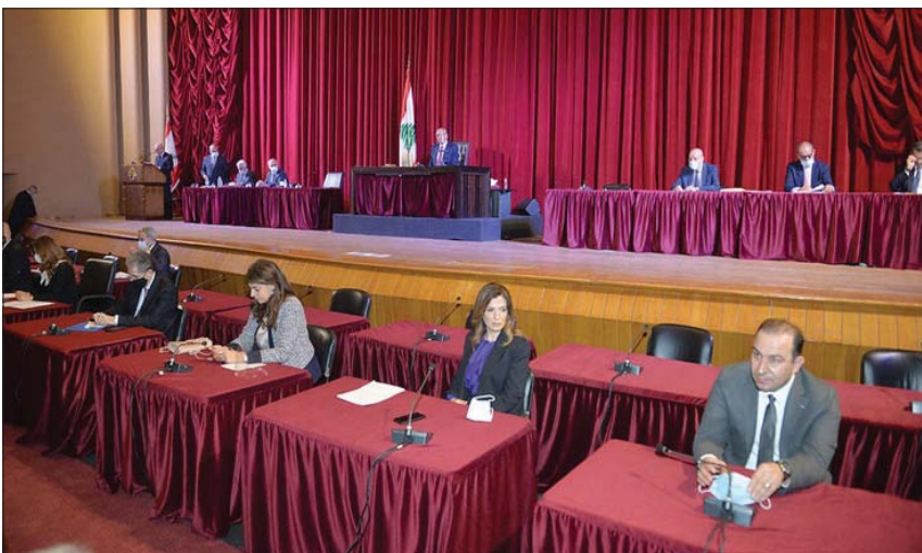
جلسة البرلمان اللبناني أمس