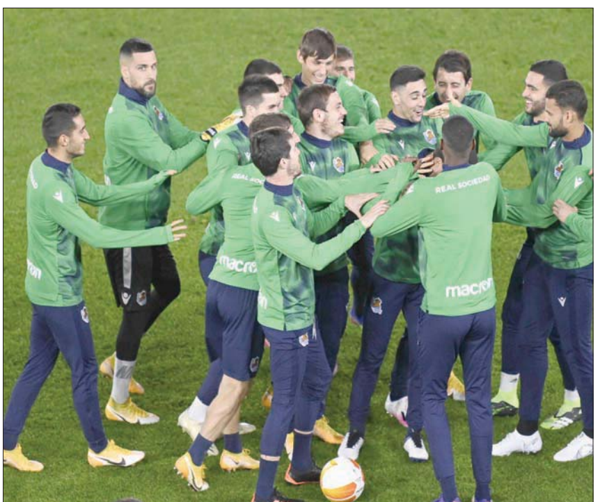
لاعبو ريال سوسيداد يقدمون موسماً لافتاً قادمهم للمصادرة الإسبانية حتى الآن

في دوري أبطال أوروبا الثلاثاء في غياب الأرجنتيني ليونيل ميسي والهولندي فرنكي دي باغ الذين فضل المدرب إراحتهم.