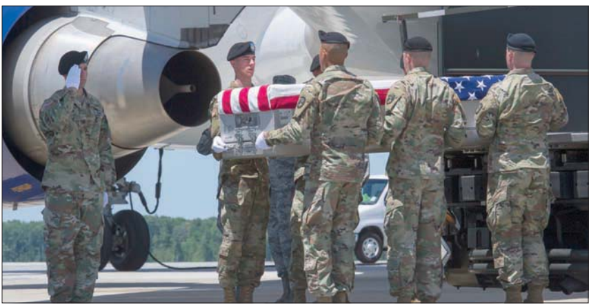
جنود أميركيون ينقلون رفات أحد زملائهم بعد مقتله في الصومال في 12 يونيو 2018