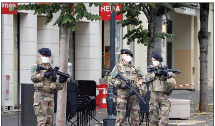
استنفار أمّني في نيس عقب جريمة قتل مدرس التاريخ صامويل باتي منتصف شهر أكتوبر الماضي

في مرسوم الحل أن المنظمة غير الحكومية تنشر وتشجع على نشر «أفكار تمييزية وعنيفة تحرض على الكراهية»، تتماشى مع التطرف خصوصاً عبر حساباتها على «فيسبوك» و«تويتر»، وعبر الحساب الخاص لرئيسها ومؤسسها على «تويتر». ولم يأخذ قاضي الأمور المستعجلة بالحجج التي قدمها الدفاع من أن الجمعية التي تأسست في 2010 تساعد أكثر من مليوني محروم في العالم.