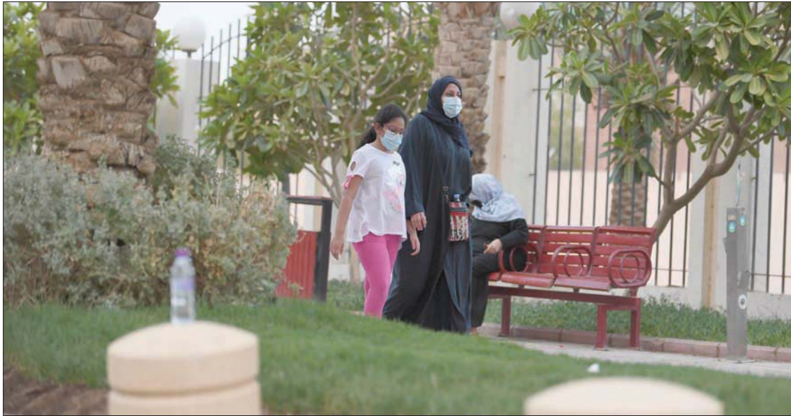
عائلة تمارس رياضة المشي في الرياض مع استقرار الحالات في السعودية

وأحدة قادمة من الخارج، كما تعافت 169 حالة إضافية ليصل العدد الإجمالي للحالات المتعافية إلى 84335. عدد الحالات القائمة تحت العناية بلغ 12 حالة، والحالات التي يتطلب وضعها الصحي تلقي العلاج بلغت 28 حالة، في حين أن 1498 حالة وضعها مستقر من العدد الإجمالي للحالات القائمة الذي بلغ 1510 حالات قائمة.