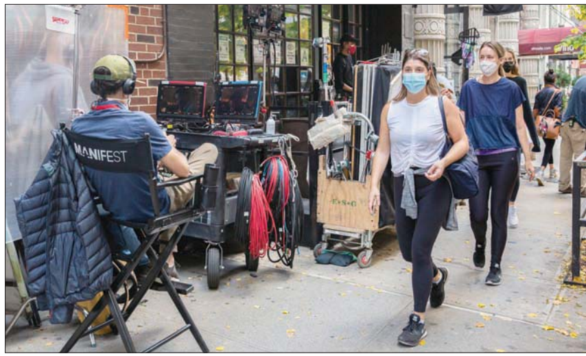
من بين 80 عملاً كان مخططاً لتصويرها في شوارع نيويورك يجري الآن تصوير 35 عملاً (نيويورك تايمز)

على سبيل المثال، داخل موقع تصوير «نيو أمستردام» في أحد أيام الثلاثاء الأخيرة، وجد طاقم العمل الكثير من المتفرجين في الجانبي والمتمنّاهات في المدينة. علاوة على ذلك، حدث تحول في طبيعة التفاعل بين الجمهور العام وأطقم صناعة الأفلام داخل المدينة. كانت أطقم صناعة الأفلام اعتادت التعامل مع مزيج من المتابعين الفضوليين و«البناءة نيويورك الحقيقيين» الذين يسرون عبر