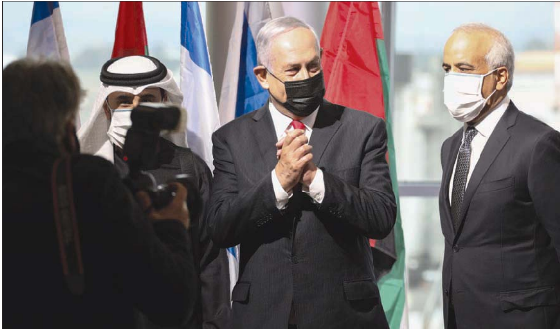
مراسم احتفالية في مطار بن غوريون الإسرائيلي لدى وصول أول رحلة تشغيلها شركة فلاي دبي بحضور نتنياهو والغيت

من جهة ثانية، أفيد بأن الزيارة العلنية الأولى التي أرادها نتنياهو، إلى المنامة بدعوة من السلطات البحرينية؛ وكانت مقررة لاسبوع المقبل، قد تأجلت. وحسب مصدر في تل أبيب فإن السلطات في البحرين هي التي طلبت تأجيل الزيارة.