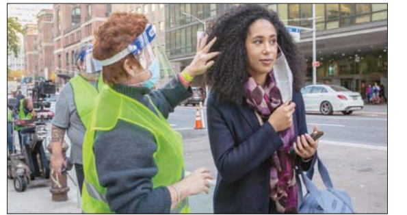
مارغو بينغام أثناء تصوير أحد مشاهد مسلسل «نيو أمستردام»

شاحنات الإنتاج المتلألئة وضجيج العمال أثناء نقلهم المعدات من داخل الشاحنات إلى أماكن التصوير، مؤشراً يبعث على الأمل ويعيد للمدينة بعضاً من روحها السابقة المفقودة. كما يساعد هذا الألف على العودة إلى أعمالهم، وتعزيز صورة مدينة نيويورك باعتبارها حاضرة صامدة في عيون الملايين بمختلف أرجاء العالم الذين يتابعون المسلسلات التي يجري تصويرها في نيويورك.