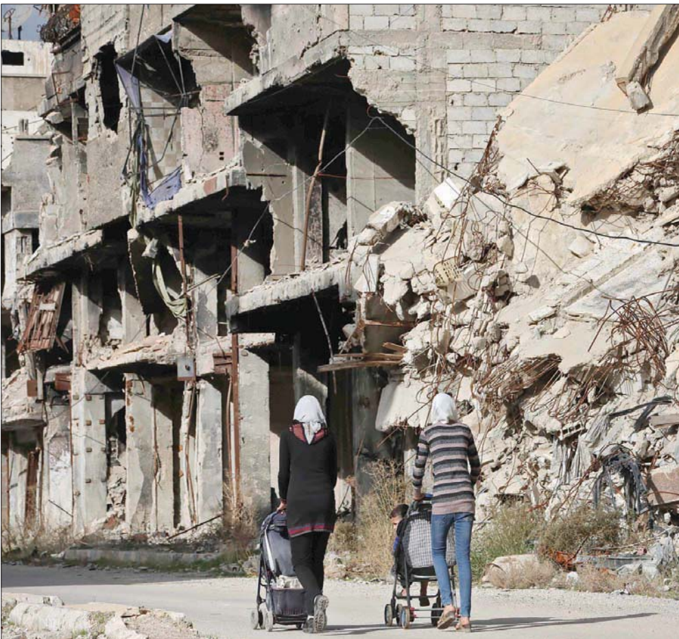
تسيران في مخيم البيروك الفلسطيني المدمر جنوب دمشق (أ.ف.ب)

ذلك الجولان السوري المحتل، الذي تعتبر زيارة المسؤول الأميركي له استفزازاً مباشراً». وقال إن «التحركات الجارية في الوضع في الجنوب السوري، أن موسكو تعتبر «زيارة بومبيو للجولان السوري المحتل، عملاً استفزازياً». وزاد: «ندعو باستمرار للحفاظ على وحدة سوريا واحترام سيادتها وسلامة أراضيها». وندعو لنذ خطط تقسيم هذا البلد وإطالة أمد النزاع فيه». وأضاف أن هذا الموقف ليسجبد على كل ملفات الوضع في سوريا «سواء في شرق البلاد أو غربها، بما في