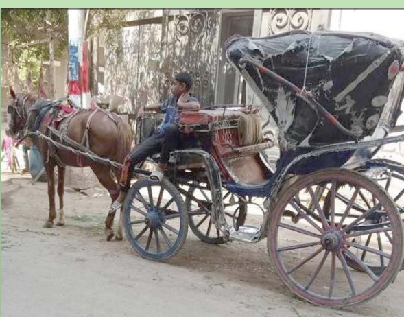
السكان يحتفظون على قيادة الصبية للحناطير لأنها تكون مصدر خطر

لعلها واحدة من المدن القليلة في مصر التي ما زالت تحتفظ بالحنطور باعتباره وسيلة مواصلاتها الرئيسية التي يستخدمها معظم الأهالي، إنها مدينة مغاغة، التابعة لمحافظة المنيا (جنوب القاهرة) التي تحظى بشهرة كبيرة باعتبارها مسقط رأس «عميد الأدب العربي» الدكتور طه حسين، الذي جعل منها مسرحاً لبعض أعماله التي من بينها سيرته الذاتية «الأيام»، أما شوارعها فما زالت حتى الآن تحتفظ بالكثير من هدونها، ورغم الإضافات العمرانية التي أدت إلى زيادة رقعتها السكانية، لم تشهد حتى الآن باستثناء السيارات الخاصة والدراجات النارية التي يمتلكها البعض، أي