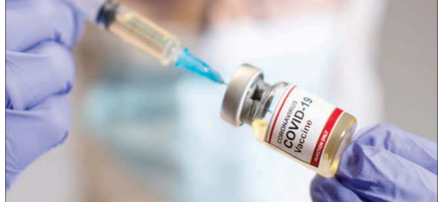
البدء بتوزيع لقاح «كورونا» متوقع في ديسمبر المقبل

الرعاية الصحية والمعرضين أكثر من غيرهم للإصابة بـ«كوفيد - 19» قبل غيرهم.