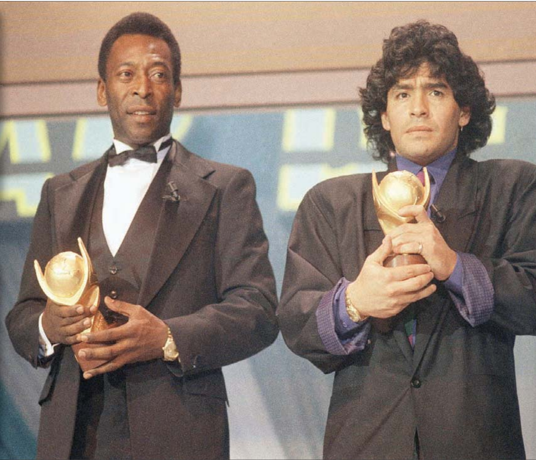
مارادونا وبيليه يتقاسمان جائزة «الفيفا» لأفضل لاعب لكرة القدم في القرن العشرين

وطالب مسؤولو نادي نابولي بإطلاق اسم مارادونا على ملعب سان باولو، مقفل الفريق الجنوبي تكريماً له على إنجازاته الخالدة مع الفريق. وربما لا يوجد بلد بعد الأرجنتين يشعر بالحزن على وفاة مارادونا مثل إيطاليا التي جلبت