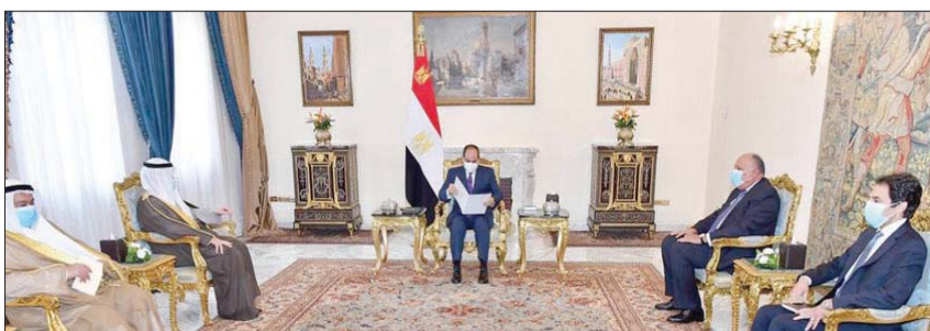
السيسي خلال استقبال وزير الخارجية الكويتي

ضد التهديدات الجوية والسطحية (غير النمطية)، وتأمين هدف حيوي بالبحر، وتقديم المعاونة لقطر سفينة بالبحر، وتمارين البحث والإنقاذ، وكذلك تنفيذ عدد من الرمايات على عدد من الأهداف الجوية والسطحية، والتي أثبتت مدى ما يتمتع به العناصر المشاركة من مهارة وقدره فائقة على إصابة الأهداف، فضلاً عن تنفيذ تدريب فرض الحكم وتأمين سفينة ذات أهمية خاصة، وكذا التدريب على مكافحة الألغام البحرية أثناء الخروج من الميناء».