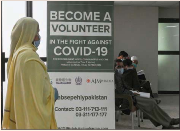
لوحة تدعو للتطوع لتجربة لقاح «كورونا» في باكستان

وجت البرامج شركات الأدوية على مشاركة ما لديها من تقنيات والتنازل عن حقوق الملكية الفكرية للسماح بإنتاج عالمي واسع للقاحات اللازمة لصحة سكان العالم من فيروس كورونا. وكشف البرنامج في تقريره السنوي، الذي نشره قبل «اليوم العالمي للإيدز»، الذي يصادف الأول من ديسمبر (كانون الأول)، أن 12 مليون شخص مصابين بفيروس نقص المناعة البشرية لم يتمكنوا من الوصول إلى الأدوية المنقذة للحياة خلال العام الماضي. كما حذر البرنامج من أن الضغوط على الخدمات الصحية وسط جائحة كورونا قد يؤدي إلى 293 ألف إصابة إضافية بفيروس نقص المناعة وما يصل إلى 148 ألف حالة وفاة إضافية مرتبطة بالإيدز حتى عام 2022.