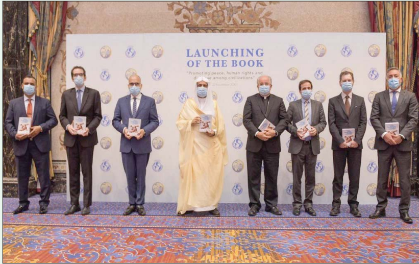
حفل إطلاق كتاب تعزيز السلام وحقوق الإنسان (واس)

جدة، «الشرق الأوسط» إبصارها إلا بأساليب الحكمة والاحترام المتبادل»، وشدد على أن رابطة العالم الإسلامي تحمل رسالة سلام تضع على عاتقها مهمة تخفيف التوترات التي تثيرها بعض المساجلات. من جانبه، أكد رئيس الأساقفة، إيفان يوركوفيتش، القاصد الرسولي ومراقب الكرسي الرسولي الدائم لدى مكتب الأمم المتحدة في جنيف والمنظمات الدولية الأخرى، أن الأخوة باتت في وقتنا الحاضر ضرورة أكثر من أي وقت مضى، موضحاً أن النتيجة الحتمية للخلفي عن لطف المواجهة هي الجوء إلى فضاء الصراخ.