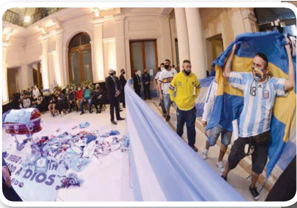
الجماهير تلقي نظرة على نعش مارادونا المسجي بالقصر الرئاسي