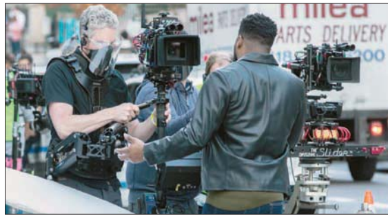
طاقم عمل «نيو أمستردام» أثناء تصوير بعض مشاهد