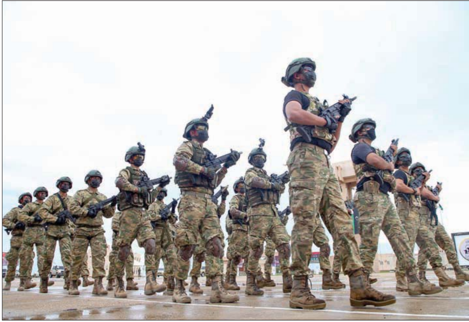
جانب من تدريبات عناصر تابعة لقوات «الوفاق» في معسكر عمر المختار بتاجوراء

في عدد الليبيين الذين يحتاجون إلى مساعدة، ويُفترض أن يدق ذلك ناقوس الخطر بأنه من الضروري اتخاذ خطوات عملية». معتبرة أن الأزمة الإنسانية في جنوب ليبيا هي الأكثر حدة، وتمنت على المشاركين في ملتقى تونس «أن يضعوا البلاد قبل المصالح الشخصية»، إلى ذلك، وأصل عقيلة صالح، رئيس مجلس النواب الليبي، زيارته إلى العاصمة الروسية موسكو؛ حيث ناقش مساء أول من أمس مع النائب الأول لرئيس مجلس الدوما، الكسندر جوكوف، ورئيس لجنته للشؤون الدولية ليونيد سلوتسكي، وعدد من أعضاء المجلس، الأوضاع في ليبيا والمنطقة، والعلاقات الثنائية بين البلدين، والتعاون البرلماني المشترك بين المجلسين.