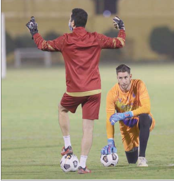
تدريبات النصر شهدت تركيزاً على الحارس الأسترالي (نادي النصر)

بأنه شارك في نهائيات كأس العالم الأخيرة التي جرت بروسيا عام 2018، كما تولى إدارة 38 مباراة ببطولة دوري أبطال أوروبا منذ عام 2014 منها تسعة لقاءات في الأدوار النهائية. وأشاد