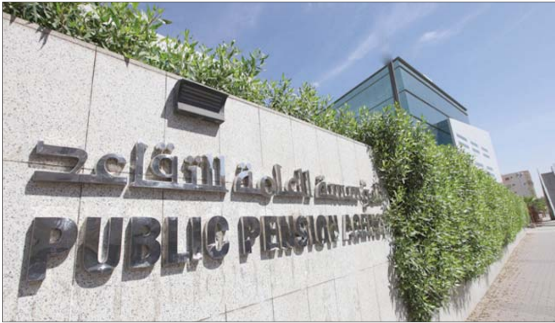
مؤسسة التقاعد السعودية تفصح عن آخر مستجدات التقاعد المبكر (الشرق الأوسط)

وتناولت النشرة التقاعد المبكر من حيث متوسط العمر عند التقاعد لدى الجنسين والذي يبلغ 50 عاماً لدى الرجال و52 عاماً لدى النساء، فيما بلغ متوسط مدة الخدمة 25,3 سنة لدى النساء مقابل 24,8 سنة لدى الرجال، كما مثل التقاعد المبكر ما نسبته 31 في المائة من أسباب التقاعد لدى الجنسين في المتوسطين العسكري والمدني فيما مثل بلوغ السن التقاعدي 53