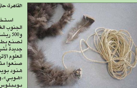
حبل ليفي ملفوف بريش الديك الرومي لصنع البطانية

من جهته، قال بروفيسور ديمتري شاباخمتوف، من مدرسة الطب التابعة لجامعة إموري بالولايات المتحدة: «يعتبر هذا سيلا جديداً لعلاج أنواع السرطان المستشرية في الجدد». وأضاف: «يمكن تسليخ الفيروس