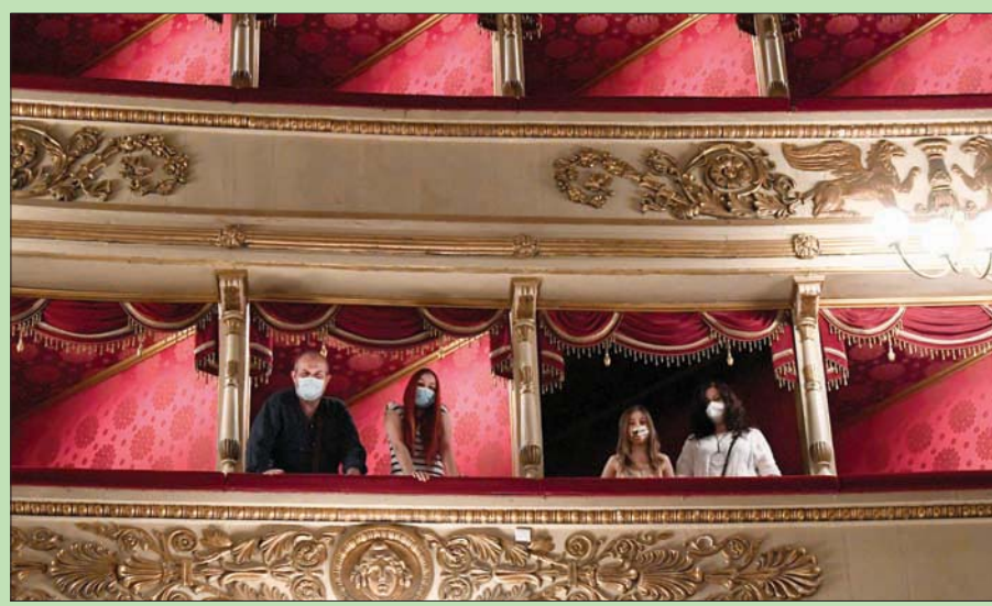
زوار يرتدون أقنعة داخل دار الأوبرا الإيطالية

فترات طرح الريش الطبيعية، وكان من شأن هذا أن يسمح بجمع الريش المصدر عدة مرات في السنة على مدى عمر الطائر، والذي كان من الممكن أن يتجاوز 10 سنوات. وتشير الدلائل الأثرية إلى أن «الديوك الرومية لم تستخدم عموماً كمصدر للغذاء منذ وقت تدجينها في القرون الأولى بعد الميلاد وحتى القرنين الحادي عشر والثاني عشر بعد الميلاد، حيث أصبحت بعد ذلك مصدراً للغذاء عندما استنفذ الإمداد بالحيوانات البرية في المنطقة بسبب الصيد الجائر.