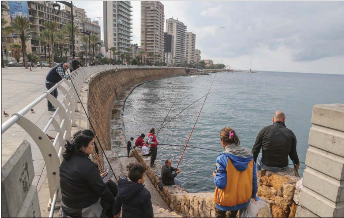
لبنانيون يمارسون هواية الصيد في بيروت قبل منع التجول الذي يبدأ الخامسة مساء كل يوم

يتحضر لبنان للعودة إلى الفتح بعد إقفال عام بدأ منذ أسبوعين تقريبا وفق خطة متكاملة «تعمل عليها حاليا اللجنة الوزارية لمتابعة كورونا»، حسب ما أكدت مستشارة رئيس الحكومة للشؤون الطبية بترا خوري.