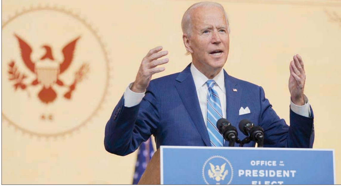
بايدن يخاطب الأميركيين بمناسبة عيد الشكر مساء الأربعاء

هذه انتخابات فزنا بها بسهولة (...). فزنا بفارق كبير». وكان ترمب يعزّم المشاركة في هذا الاجتماع. غير أنه الغي مشاركته فجأة بعدما ثبتت إصابة مستشار في حملته بـ«كورونا». ولاحقاً، دعا ترمب بعض مشرعي بنسلفانيا إلى البيت الأبيض لمناقشة «مخالفات التصويت»، على غرار ما فعله مع مجموعة من المشرعين في ميشيغان.