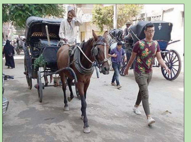
الحنطور ما زال قادراً على توفير لقمة العيش الكريمة لأصحابه