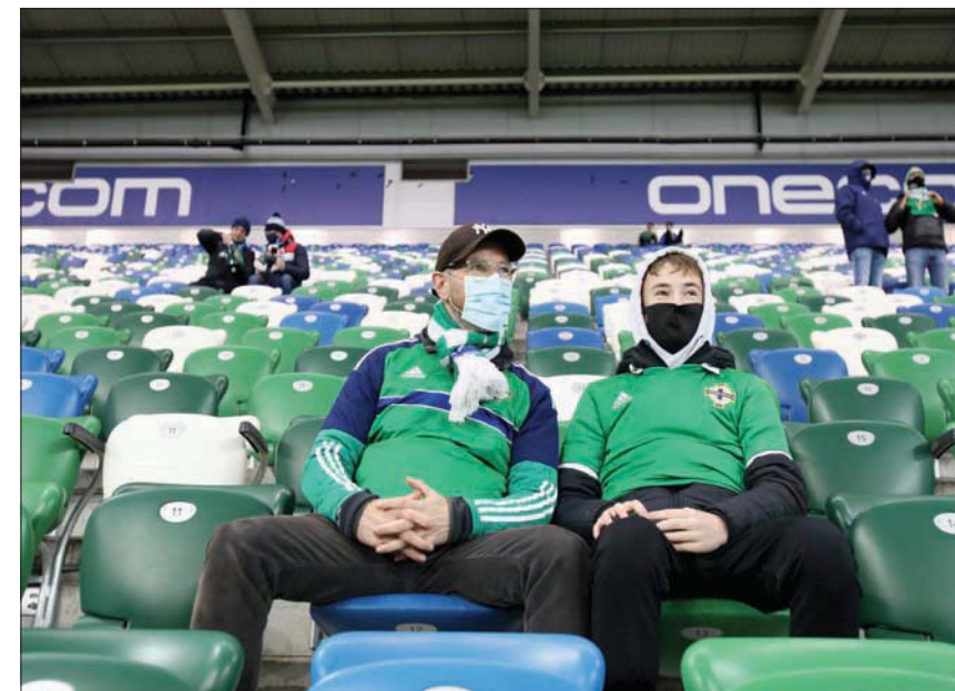
جماهير الكرة تستعد للعودة إلى الملاعب الإنجليزية في الرابع من ديسمبر

ويلعب تشيلسي وبرايوتون على أرضهما ضد ليدز وساوثهامبتون تواليها، فيما يحل ولغرهامبتون ضيفاً على ليفربول حامل اللقب في ملعب ليفربول، بينما قد يستقبل ملعب أتلتيكو مدريد في ملعبه بلندن عند استضافة مانشستر يونايتد.