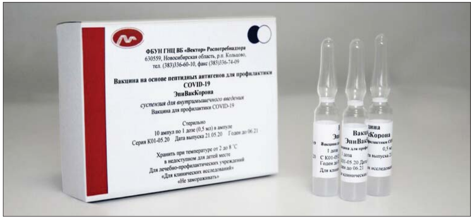
إطلاق المرحلة الثالثة للقاح إبي فاك كورونا الروسي (روسيا اليوم)

في روسيا، حيث اقتربت حصيلة الإصابات اليومية لأول مرة منذ بداية الجائحة من عتبة 25,5 ألف. وأعلنت غرفة العمليات الخاصة بمحاربة انتشار الفيروس التاجي في روسيا اليوم الخميس، في تقريرها اليومي، عن رصد 25487 إصابة جديدة بالوباء خلال الساعات الـ 24 الماضية، مقابل 23675 إصابة في اليوم السابق، مشيرة إلى عدم ظهور أعراض الإصابة لدى 21,6 في المائة من المرضى الجدد. وتوزع الإصابات الجديدة بين جميع أقاليم روسيا الـ 85. وفي مقدمتها العاصمة موسكو (6075 إصابة) ومدينة سان بطرسبورغ (3669 إصابة)، أي أكبر زيادة منذ بداية الجائحة.