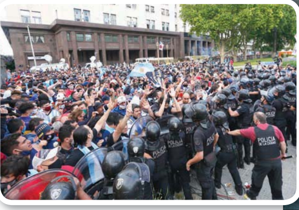
الآلاف احتشدوا خارج القصر لإلقاء نظرة على جثمانه

عرف بيليه ناديين فقط خلال مسيرته الطويلة، سانتوس بين (1956 - 1974)، وكوزيموس (1975 - 1977). وكان ينظر إليه دائماً كبطل ملتزم، وقادة في عالم اللعبة. أما مارادونا، ابن بلاد المشايخ على المستطيل الأخضر أنجبت تشي غيفارا، فكان الطفل المشايخ على المستطيل الأخضر وخارجه، تنقل بين 6 أندية، نال بطاقة حمراء في مونديال 1982، طرد من المنتخب خلال مونديال الولايات المتحدة 1994 بعد فشله في فحص منشطات، وعانى من إدمان تعاطي الكوكايين.