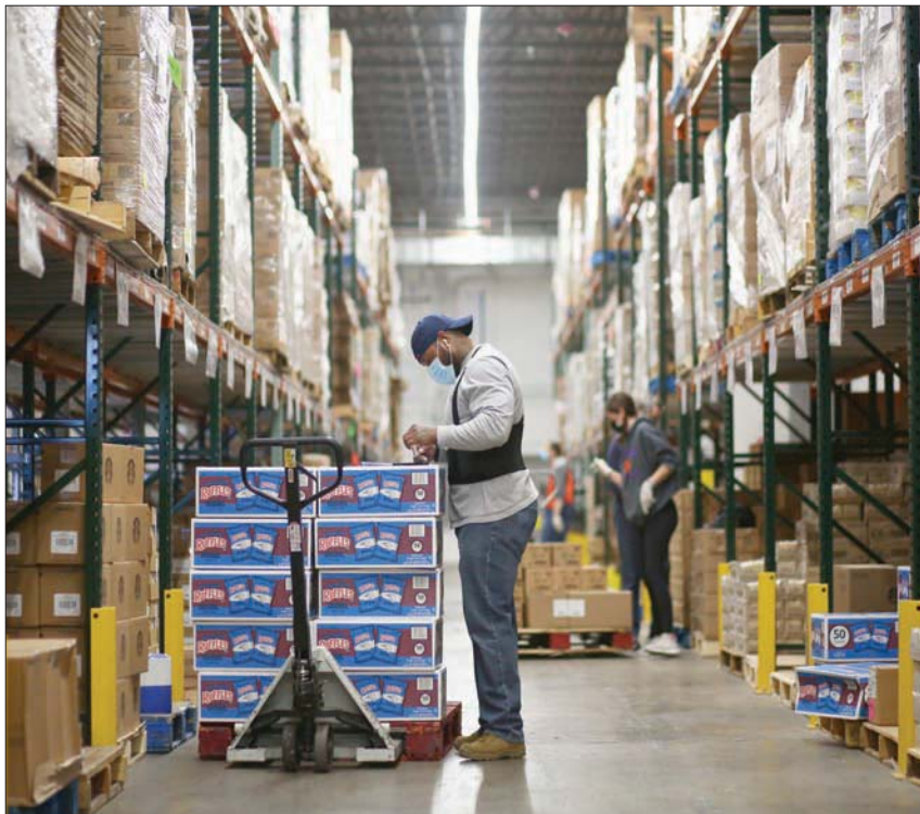
تشير بيانات مختلفة إلى صورة شديدة الغموض حول الوضع الاقتصادي الأمريكي

وصوت مسؤولو مجلس الاحتياطي لصالح إبقاء أسعار الفائدة دون تغيير في اجتماع نوفمبر، وجددوا تعهدهم ببذل كل ما يمكن لدعم تعافي الاقتصاد