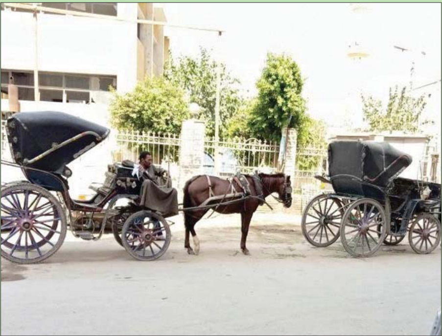
عربات الحنطور الوسيلة الرئيسية لنقل سكان مدينة مغاغة المصرية

لعلها واحدة من المدن القليلة في مصر التي ما زالت تحتفظ بالحنطور باعتباره وسيلة مواصلاتها الرئيسية التي يستخدمها معظم الأهالي، إنها مدينة مغاغة، التابعة لمحافظة المنيا (جنوب القاهرة) التي تحظى بشهرة كبيرة باعتبارها مسقط رأس «عميد الأدب العربي» الدكتور طه حسين، الذي جعل منها مسرحاً لبعض أعماله التي من بينها سيرته الذاتية «الأيام»، أما شوارعها فما زالت حتى الآن تحتفظ بالكثير من هدونها، ورغم الإضافات العمرانية التي أدت إلى زيادة رقعتها السكانية، لم تشهد حتى الآن باستثناء السيارات الخاصة والدراجات النارية التي يمتلكها البعض، أي