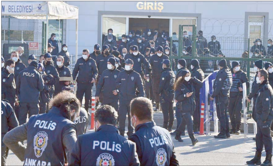
شرطة مكافحة الشغب أمام محكمة في أنقرة أمس خلال إصدار الأحكام ضد مئات المتهمين في «المحاولة الانقلابية» عام 2016

ورسائل منشورة على مواقع التواصل الاجتماعي قبل حبسه احتياطياً لعام وشهرين، حتى مارس (آذار) 2018. وأكد القضاة أن مقالاته «لها قيمة المعلومات الصحافية وتسهم في النقاش العام» في تركيا، وخلصوا إلى أنه «لا أسباب معقولة للاشتباه في أنه ارتكب جريمة جنائية»، وأن احتجازه يشكل «تدخلاً في ممارسة حقه في حرية التعبير». وأمرت المحكمة تركيا بدفع 16 ألف يورو للصحافي تعويضاً عن الضرر المعنوي الذي لحق به.