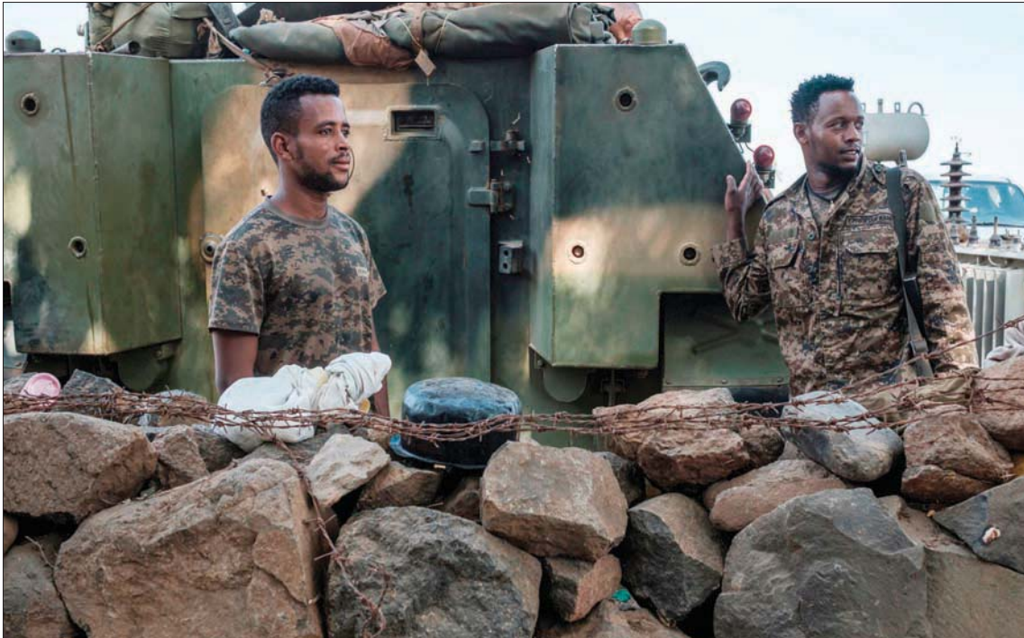
عصران من الجيش الإثيوبي أمام مدخل الكتيبة الخامسة في مدينة دانشا أمس

واستجابة للمهلة استسلم عدد كبير من القوات الخاصة والميليشيات التابعة للجبهة الشعبية لتحرير تيغراي التي عبر إقليم عفرها، كما أن القوات المعزولة الأخرى في منطقة