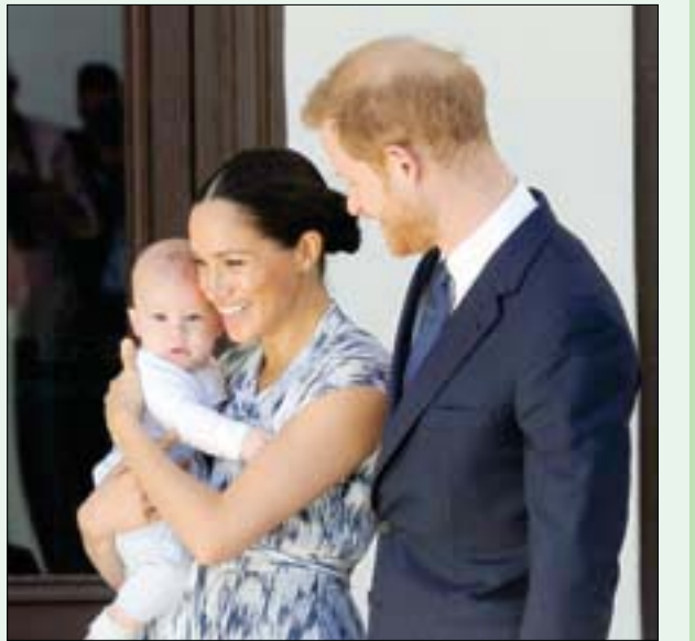
الأمير هاري وزوجته ميغان ماركل مع طفلهما أرشي العام الماضي

لندن، «الشرق الأوسط» شعرت فيها بالمرح حاد أوقعتها أرضاً بينما كانت تغير حفاظات ابنها أرشي وكتبت: «علمت في اللحظة التي كنت أضغ طفلي البريطاني بسبب إيجابتها على سؤال لأحد الصحافيين «هل أنت بخير؟» أجابت الدوقة بصراحة غير معتادة من أفراد العائلة المالكة، لم تختبئ خلف ستار الدبلوماسية والاعراف الملكية بل تحدثت عن مشاعرها كام جديدة وما تعانيه. لم تستطع ماركل التناقل مع البروتوكول الصارم الذي يلتزم به أفراد العائلة المالكة وخرجت هي وزوجها من ذلك الوسط لتعيش حياة مختلفة في لوس أنجلوس.