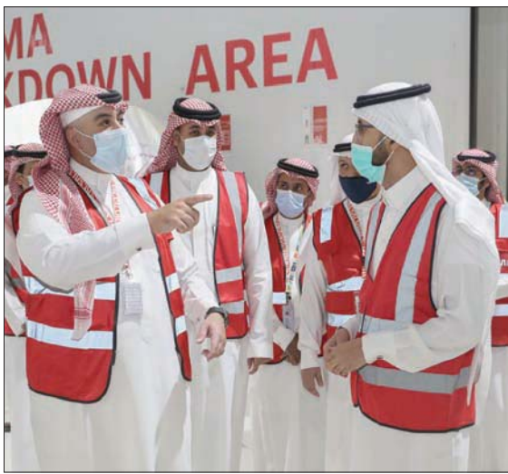
لقطة لافتتاح مرافق التخزين في الرياض

بالفيروس، ليرتفع إجمالي الإصابات في البلاد إلى 162 ألفاً و662 حالة. ولفتت إلى أن 783 مصاباً تماثلوا للشفاء، ليرتفع إجمالي المتعافين في البلاد إلى 151 ألفاً و44 حالة.