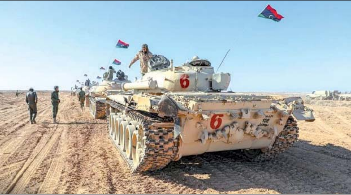
صورة وزعها «الجيش الوطني» لمناورة قواته

ميداناً، اتهمت قوات حكومة الوفاق «الجيش الوطني» بمضايقة السواتر الترابية في بوابة الـ30 غرب سرت، وإجواز سواتر ترابية جديدة فيما يعرف بـ«شعبية المرحال» في محيط جارف وما حولها. ونقلت وسائل إعلام محلية عن عضو بغرفة العمليات الميدانية لتحرير سرت والجفرة رصد خروج مجموعات من المرتزقة الروس من منطقة الحنيوة، جنوب سرت متجهة إلى الجفرة.