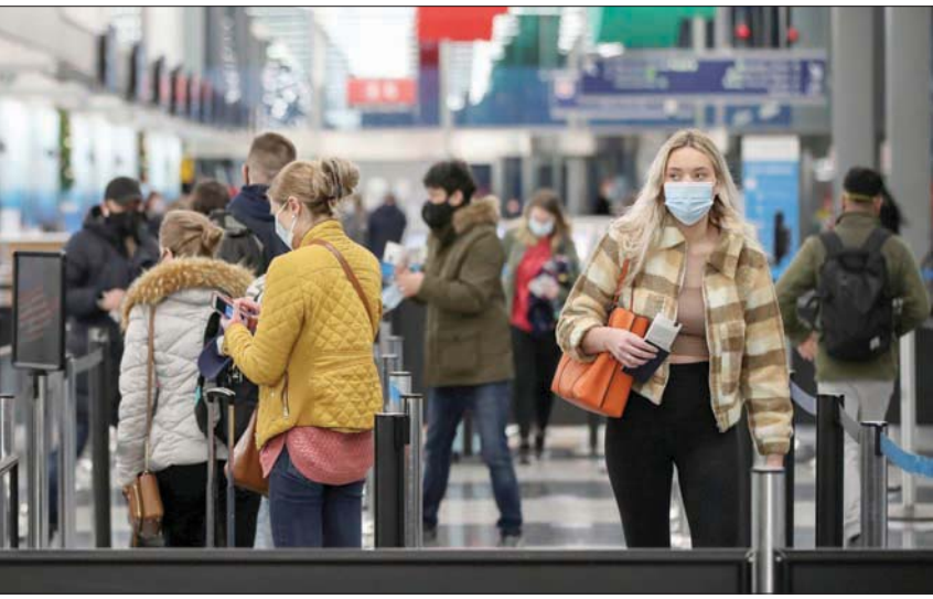
مسافرون يصلون إلى مطار شيكاغو أمس

البلدان تضرراً من حيث عدد الوفيات والإصابات مع تسجيلها 257,707 وفيات من 12,421,216 إصابة، حسب تعداد جامعة جونز هوبكنز، وفيما لا يقل عن 4,633,600 شخص في البلاد. بعد الولايات المتحدة، أكثر الدول تضرراً من الوباء هي البرازيل حيث تسجل 169,485 وفاة من أصل 6,087,608 إصابات، ثم الهند مع 134,218 وفاة (9,177,840 إصابة) والمكسيك مع 101,926 وفاة (1,049,358 إصابة) والمملكة المتحدة مع 55,230 وفاة (1,527,495 إصابة).