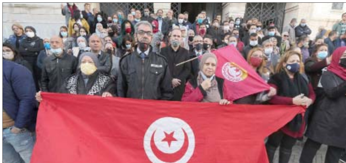
جانب من الاحتجاجات التي شهدتها شوارع العاصمة التونسية أول من أمس

جهة على حدة». ودافع المشيشي عن الحكومة التي يقودها منذ بداية سبتمبر (أيلول) الماضي، بالتاكيد على أنها «لا تتركس ثقافة الاعتباط خصوصيات كل