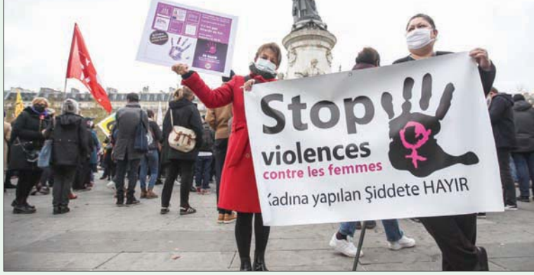
مظاهرات تتجمع في ساحة «لا ريبابليك» بباريس في اليوم العالمي المناهضة للعنف ضد المرأة

وتضمن البرنامج، بحسب بيان الجامعة، محاضرات علمية وعملية، للتدريب على كافة سبل مواجهة العنف ضد المرأة، وكيفية التعامل معه على المستوى القانوني أو النفسي أو الصحي أو الرياضي. وحقق المسلسل المصري «الآن» الذي يهتم بمعالجة قضايا النساء في مصر، عبر عرض سلسلة كتابات منفصلة، كل حكاية مكونة من 10 حلقات، تناقش كل منها أزمة محددة، انتشرت لاحقاً في مصر بالآونة الأخيرة، ما دفع «المجلس القومي للمرأة» المصري للإشادة به، وبدوره المهيم. وقالت الدكتورة مايا مرسى، رئيسة المجلس في بيان صحافي أمس، إن «وحدة الرصد الإعلامي بالمجلس تقوم برصد وتحليل حلقات المسلسل، في إطار دورها في متابعة صورة المرأة بجميع وسائل الإعلام الدراما، لافتة إلى أن النجاح الذي حققه المسلسل يصب في صالح المرأة من خلال نشر الوعي بقضاياها؛ حيث إن الدراما هي أقصر الطرق لنشر الوعي بقضايا المجتمع والمرأة بشكل خاص».