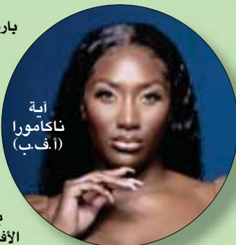
آية ناكامورا

ترفض الفنانة الفرنسية، آية ناكامورا، وهي التي تجذب أغانيتها أكبر عدد من المستمعين حول العالم، زجها ضمن قوائم نبطية. وكانت قد فرضت آية ناكامورا أسلوبها الخاص بلغة دارجة وإنغام البوب الأفريقية. وتقول المغنية «نجحت