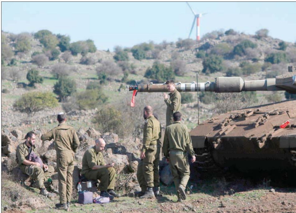
جنود إسرائيليون يقفون أمس إلى جانب دبابتهم في مرتفعات الجولان قرب الحدود مع سوريا

منطقة وعرة على بعد 15 كيلومتراً جنوبي وسط دمشق. وقالت مصادر عسكرية، إن المنطقة التي تعرضت للغارات فيها صواريخ مضادة للطائرات، واستهدفت الغارات منطقة تقع في مساحة تمتد من ريف دمشق الجنوبي إلى هضبة الجولان، حيث تعتبر إسرائيل الوجود الإيراني المتنامي تهديداً استراتيجياً.