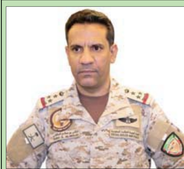
العميد الركن تركي المالكي