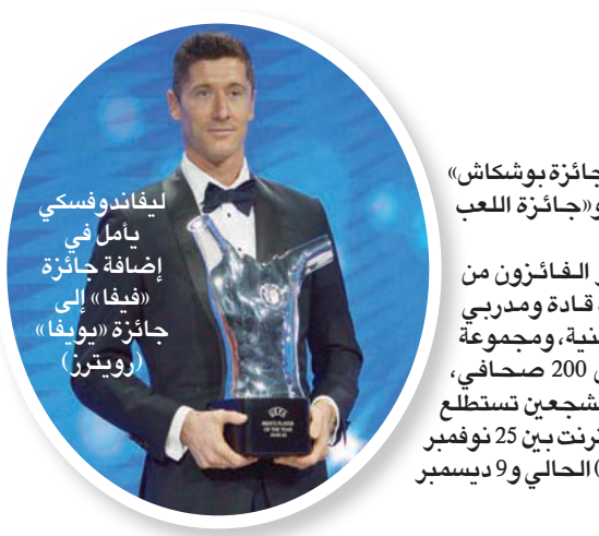
ليفاندوفسكي ياحل في إضافة جائزة «فيفا» إلى جائزة «يوبا» رويترز

يسعى كل من أرسنال وليستر الإنجليزيين، وهو فنهائم الألماني وفياربال الإسباني، إلى حسم تأهلهم المبكر إلى دور الـ32 لمسابقة الدوري الأوروبي (يوروبا ليغ) عندما يخوضون الجولة الرابعة اليوم. كما تتطلع أندية ميلان الإيطالي وتوتنهام الإنجليزي وريال سوسيداد الإسباني، إلى نقل تفوقها المحلي إلى المسابقة الأوروبية. والفوز اليوم سيقربها من الدور الثاني قبل جولتين من ختام دور المجموعات.