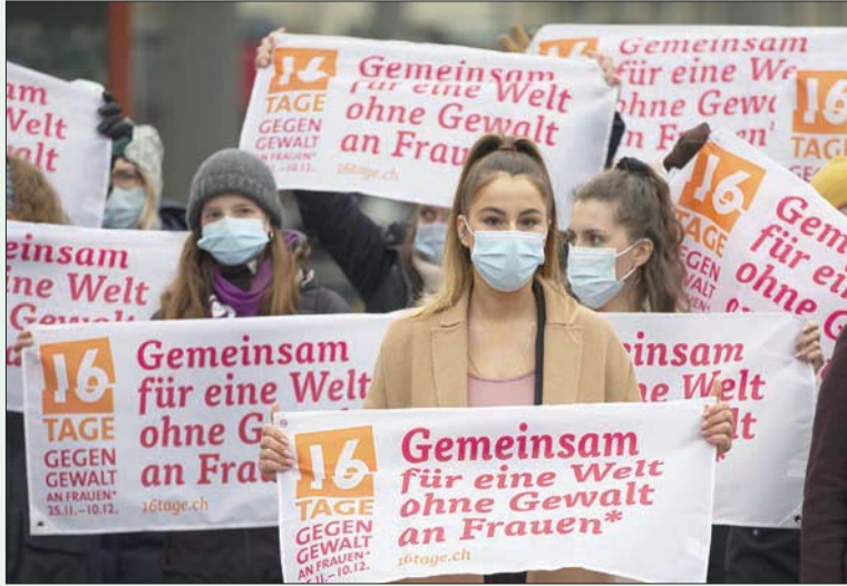
احتجاج على العنف ضد النساء في بيرن بسويسرا