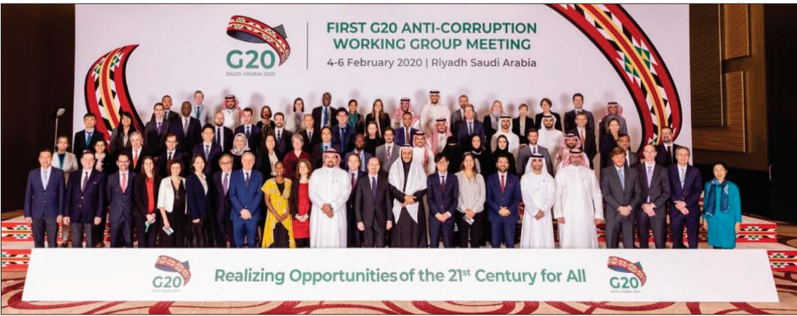
رئاسة السعودية خلال استضافة وزراء مكافحة الفساد في دول العشرين فبراير الماضي بحضور المنظمات الدولية

لدول مجموعة العشرين، الذي يُقدم للمرة الأولى، من العاصمة السعودية، استعراضاً معقداً للمقدم الجماعي المحرز لدول المجموعة في مجالي التعاون الدولي واسترداد الموجودات، الذي سوف يُستمرش به في تحديد مجالات العمل المستقبلية المحتملة في هذين المجالين.