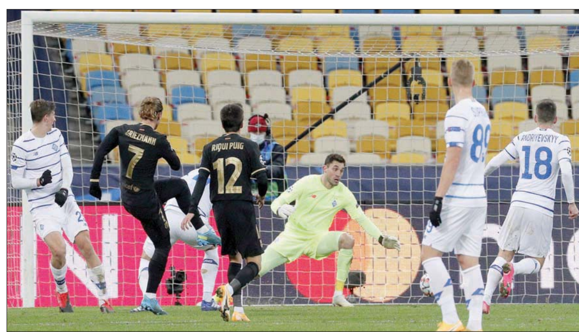
غريزمان مهاجم برشلونة (الثاني من اليسار) يسجل رابع أهداف فريقه في مرمى دينامو كييف

وعلى ملعب أولدترافورد، كانت المباراة ثأرية لمانشستر يونايتد كونه خسر بشكل مفاجئ ذهابا أمام منافسه التركي 1-2 في 4 نوفمبر بعد بداية جيدة شهدت فوزه على سان جيرمان وصيف البطولة العام الماضي 1-2 في عقر دار الأخير قبل أن يحقق فوزا كاسحا على لايبزيغ الألماني بخمسة نظيفة في الجولة الثانية. ونجح مانشستر يونايتد في فرض سيطرته منذ بداية المباراة وأثمر ذلك عن هدف أول في الدقيقة السابعة للبرتغالي المناق برونو فرنانديز بقذيفة من مشارف المنطقة على الطائر، في سقف الشباك التركية. ويعد تم إلغاء هدف ماركوس راشفورد بداعي التسلل، قبل أن يرتكب حارس الفريق التركي فهمي ميرت غونوك خطأ فادحا في التعامل مع تمريرة عرضية عالية أفلتت منه الكرة ليتابعها فرنانديز داخل الشباك في الدقيقة 20. وشن مانشستر يونايتد هجمة مرتدة سريعة في الدقيقة 35 قادها راشفورد الذي أعيق داخل المنطقة فاحتسب الحكم ركلة جزاء لصالح