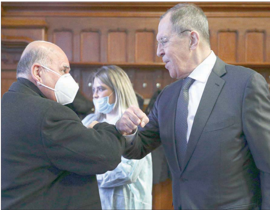
لافروف وحسين خلال مؤتمرها الصحافي المشترك في موسكو أمس