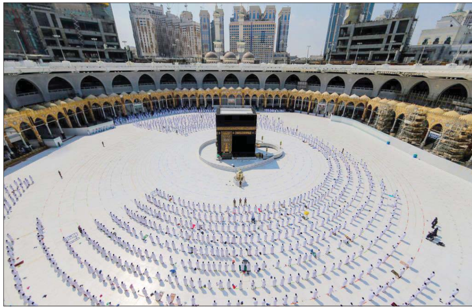
الإجراءات الوقائية ساهمت في عدم تسجيل أي إصابات بـ«كورونا» (واس)

جدة، سعيد الأبيض أكد الدكتور عبد الفتاح مشاط، نائب وزير الحج والعمرة السعودي، نجاح المرحلة الثالثة وفق المخطط والإجراءات المتبعة، ولم تُسجل حتى هذه اللحظة تعرض أحد المعتمرين لأي إصابة بفيروس «كورونا» نتيجة الضوابط والبروتوكولات المعمول بها في تسيير قوافل المعتمرين.