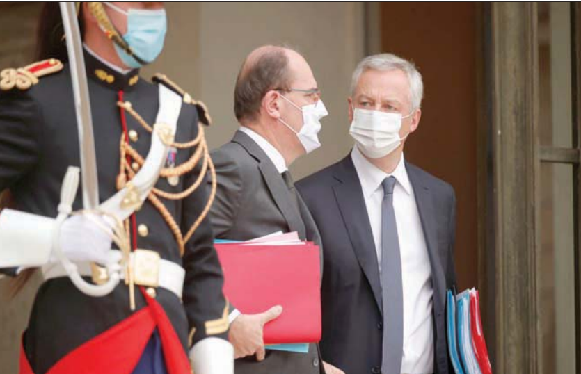
رئيس الوزراء الفرنسي ووزير المالية عقب الاجتماع الوزاري الأسبوعي في الجزيرة أمس

نوعها في العالم تجاه شركات مجموعة «غافا» و«غوغل» وأبل وفيسبوك وأمازون وغيرها من الشركات متعددة الجنسيات المتهمه بالتهرب الضريبي. وبلغت عائدات هذه الضريبة 350 مليون يورو في 2019. وردت واشنطن على هذه الضريبة التي تعدها تميزية ضد الشركات الأميركية، فهددت بفرض رسوم جمركية بنسبة 100% على بعض المنتجات الفرنسية ولا سيما الألبان ومستحضرات التجميل وحقائب اليد.