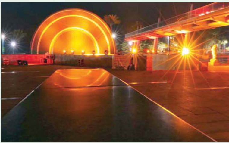
مكتبة الإسكندرية مضاءة باللون البرتقالي احتفالاً باليوم العالمي للقضاء على العنف ضد المرأة