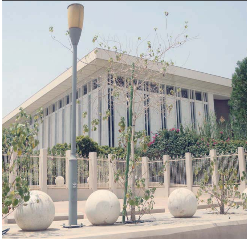
إقرار تغيير اسم مؤسسة النقد العربي السعودي إلى البنك المركزي السعودي

ويمنح النظام الجديد للبنك المركزي، على ارتباطه بشكل مباشر مع خادم الحرمين الشريفين الملك سلمان بن عبد العزيز، مع استمرار تمتع البنك المركزي بالاستقلال المالي والإداري، لمواكبة الممارسات العالمية للبنوك المركزية، كما تضمن النظام حكماً يقضي بحل «البنك المركزي السعودي» محل «مؤسسة النقد العربي السعودي» في جميع حقوقها والتزاماتها.