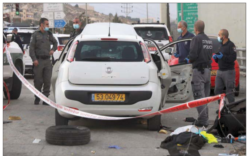
عناصر من الشرطة الإسرائيلية يفحصون سيارة الفلسطيني الذي قُتل بعد محاولة دهس مزعومة

تنفيذ 11 أمر هدم حتى أمس. وتقول إسرائيل إن السكان هناك يقيمون بشكل غير قانوني فوق أراضي تستخدم للتدريب العسكري أو أراضي دولة، لكن السكان يقولون إنهم موجودون هناك قبل وصول إسرائيل. وتضمن مسافر ربما خرباً عدة، منها أم الخير، واللواتي، وأم الصفا، وسوسيا، وأم النبر، والمغفرة، ترتب على مساحة 40