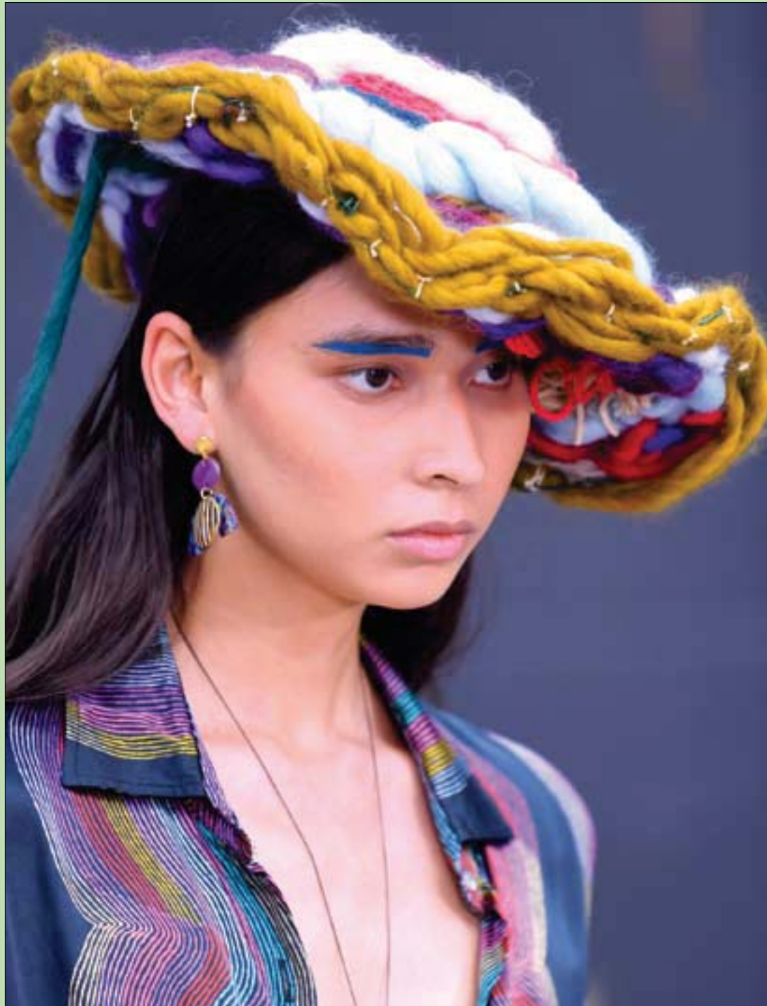
عارضة تقدم زياً خلال أسبوع الموضة في ميلبورن أمس

وقد يطبق على أي لباس يرتديه الإنسان، سواء البنطلون أو (تي شيرت) أو الثوب، وفيه (زر صغير مخفي) يتحكم فيه من يرتديه، إن أراد أن يشاهده الناس ضغطه، وإن كان يريد أن يخفي عن الأنظار فيضغطة أخرى يصبح (في خير كان) - بمعنى أنه إذا أراد أن يدخل (التواليت) - يدخل، وهو (آخر السطأ) وسط الأنوار الساطعة، من دون أن يخدش حياءه أي متطفل.