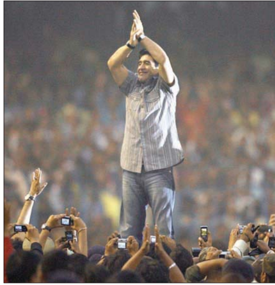
رحل مارادونا معشوق جماهير الأرجنتين وأسطورتها الأبرز

بوينس آيرس، «الشرق الأوسط» جاء خبر وفاة أسطورة كرة القدم دييغو أرمادو مارادونا أمس مثل الصاعقة على جموع الشعب الأرجنتيني، الذي هزول بضواحي العاصمة بوينس آيرس، حيث كان يتعافى من آثار جراحة بالمخ، بينما أعلن رئيس الأرجنتين البرنو فرنانديز الحداد العام بالبلاد لثلاثة أيام. وكان سانثياس مورلا محامي الأسطورة الأرجنتينية هو أول من أعلن أمس عن وفاة مارادونا، الذي احتفل منذ أيام