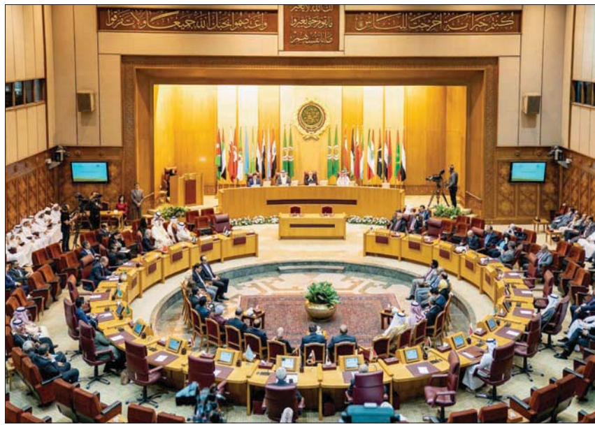
جانب من اجتماعات الجائزة السابقة (الشرق الأوسط)

ودعا مجلس الوزراء جميع المسؤولين والعاملين بالجهاز الإداري للدولة إلى «الاستمرار بتعزيز الأداء كل في موقعه، لتطوير الأداء الحكومي والنهوض بمستوى الخدمات المقدمة للمواطنين، مع تفعيل المشاركة في هذه الجائزة بدوراتها المقبلة».