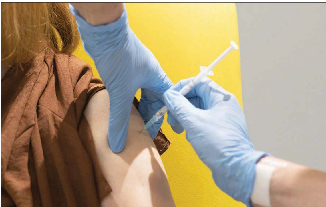
5 مليارات دولار لتوزيع ملياري لقاح على الدول المحتاجة في العام المقبل (أ.ب)

جنييف، شوقي الرئيس يُفيد تقرير داخلي أعده خبراء منظمة الصحة العالمية بأن كسر سلسلة انتشار فيروس «كورونا» المستجد في العالم لن يتحقق قبل أن يصل مستوى المناعة بين السكان إلى نسبة تتراوح بين 60 في المائة و70 في المائة. وقالت سمية سومياتان، كبيرة الخبراء في المنظمة، إن المناعة الجماعية يمكن أن تتحقق بشكل طبيعي عن طريق إصابة هذه النسبة من سكان العالم بالوباء، لكن ذلك يستغرق فترة طويلة قد تدوم سنوات وتنتج عنه خسائر بشرية فادحة. وأضافت أن السبيل الوحيد لتفادي ذلك هو توفير التمويل اللازم لمنظمة «كوفاكس» التي أطلقتها المنظمة بهدف تصافر وتنسيق جهود البحث العلمي لتطوير اللقاحات وتحديد أسعار معقولة لها وتوزيعها على جميع البلدان.