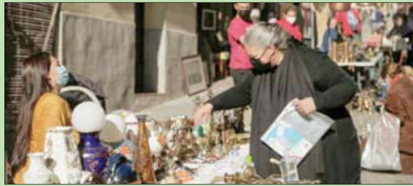
تسبب الوباء في توقف سوق إل راسترو بمدريد ما سمح للمحلات بجذب المتسوقين

مبنى واحد إلى الجنوب، يقع شارع «كالي ديل كارنيرو»، ويضم بين جنباته مزجاً متنوعاً من الباعة، داخل «المونيدو تكسومين»، قطع فاخرة من مدرسة «أرت نوفو»، وعلى بُعد أبواب قليلة، يوجد متجر مملوك للتاجر الشهير أندريس سيرانو الذي يُعتبر مصدراً رئيسياً للمقطع الخزفية والزجاجية قديمة الطراز. وقبل الوباء، كان النزهة في «ريبيرا دي كورتيدورس» صباح الأحاد من النشاطات المفضلة لكثيرين، وربما يعاود استقبال الجماهير قريباً. في المقابل، فإنه من الأثني إلى السبت، لطالما تميز الشارع الذي تصطف الأشجار على جانبيه بالهدوء، خاصة أن أكبر منطقتين للتسوق عبارة عن ساحتين داخليتين، المنطقتين «نوفاس غاليرياس بيلار لوسيون» المتخصصة في بيع الأزياء وإكسسوارات كلاسيكية فائقة من إنتاج أسماء تجارية إسبانية وعالمية أخرى بارزة. ويعتبر «فيريدي غابان» من الوافدين الجدد على المنطقة، ويضم مجموعة واسعة من الأدوات المنزلية المتنوعة. على الجانب المقابل من الشارع، يوجد «غاليرياس بيكر»، المتخصصة بمجال الديكور الداخلي، بجانب قرابة 20 متجراً أخرى. وتزخر المنطقة بقطع فنية من مدرسة «أرت نوفو» وتماثيل وقطع أثاث من مختلف أرجاء القارة الأوروبية من القرون الثامن عشر والتاسع عشر والعشرين.