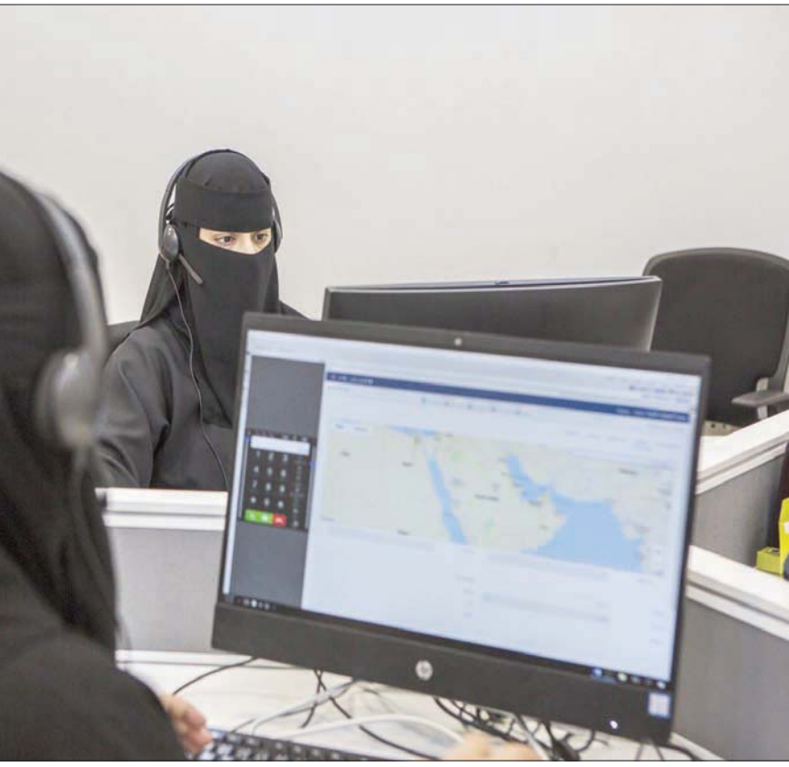
أثناء رئاسة السعودية لـ «مجموعة العشرين» أخيرا، وصلت مشاركة النساء إلى أكثر من 33,8% من حجم التمثيل