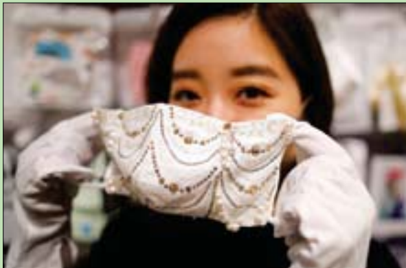
عرض قناع فاخر مزين بالألماس والكريستال

طوكيو - لندن: «الشرق الأوسط» منخفضة بسبب (كورونا)، ومن الجميل أن يشعروا بقدر من البهجة عند رؤية واحد من هذه الأقنعة المتألقة». وأضافت: «صناعة المجوهرات والنسيج أيضاً في حالة ركود بسبب فيروس (كورونا)، لذا أقدمنا على هذه الخطوة في إطار مشروع للمساعدة في إعاش اليابان».