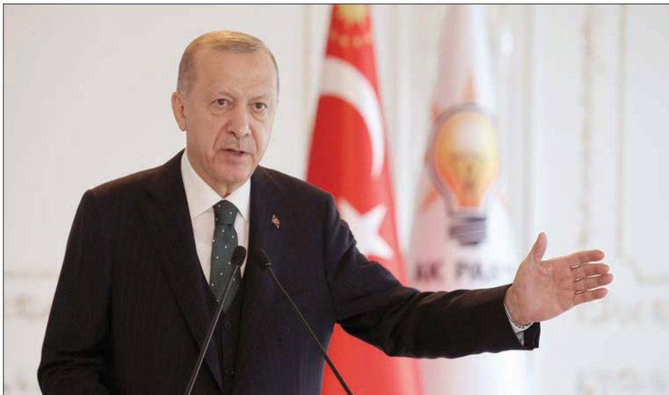
رجب طيب أردوغان