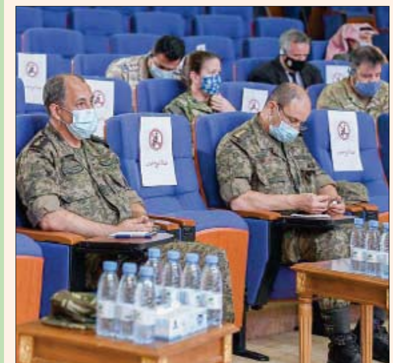
من مؤتمر المتحدث باسم الفريق المشترك لتقييم الحوادث في الرياض أمس (واس)

أكد فريق تقييم الحوادث في اليمن صحة الإجراءات التي قامت بها قوات التحالف في عدة حالات وردت من بعض المنظمات، من أبرزها استهداف مبنى مستخدمه ميليشيا الحوثي مركز قيادة واتصالات في حجة، واستهداف عربة تحمل عناصر حوثية في صنعاء، وأن هذه الإجراءات تتفق مع القانون الدولي الإنساني وقواعده العرفية.