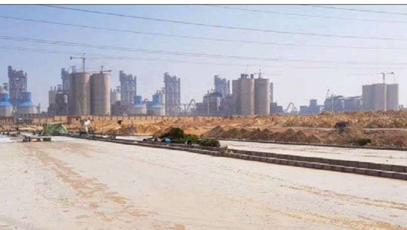
استحوذت مصر على 32 % من المشروعات المنفذة داخل تجمع «كوميسا»

الاستثمار وأبرز فرص الاستثمار المتاحة في القطاعات المختلفة داخل السوق المصرية. كما أعرب عن استعداد الهيئة الكامل للعمل على إزالة أي تحديات تواجه المستثمرين، وفتح قنوات الاتصال مع أعضاء الغرفة، من خلال التنسيق الدائم مع إدارتها واللجان المختصة. كما أوضح خطوات الهيئة لتحسين مناخ الاستثمار واستهداف كبرى الشركات العاملة في مصر وتحفيزها على التوسع وضخ استثمارات جديدة، مشيرا إلى أن الهيئة أصبحت تتبع استراتيجية للاستثمار المستهدف، حيث يتم عرض فرص الاستثمار المتاحة في القطاعات ذات الأولوية على الدول