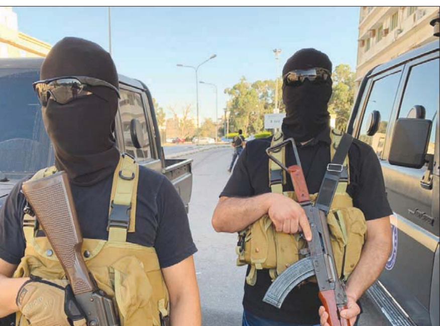
عناصر من الميليشيات الموالية لحكومة الوفاق في مصراتة

وهذا البيان رئيسة البعثة الأمامية بالإنابة ستيفاني ويليامز على عملها الممتاز، وجذّده دعمه وتشجيعه معارضتهم لأي تدخل أجنبي، ودعم رغبتهم في الدخول والدولية إلى الامتتاع عن المبادرات