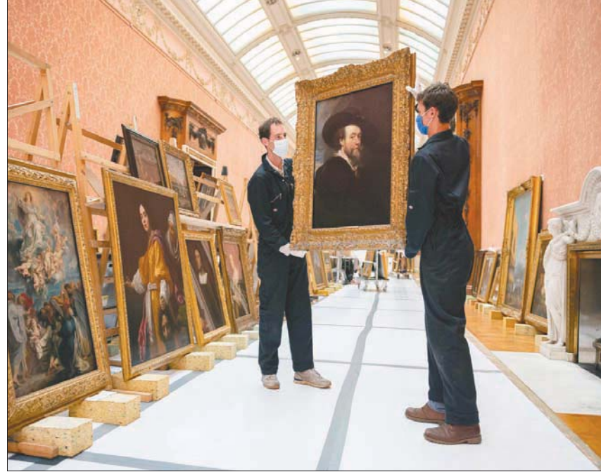
أثناء عملية نقل اللوحات من قصر باكنغهام