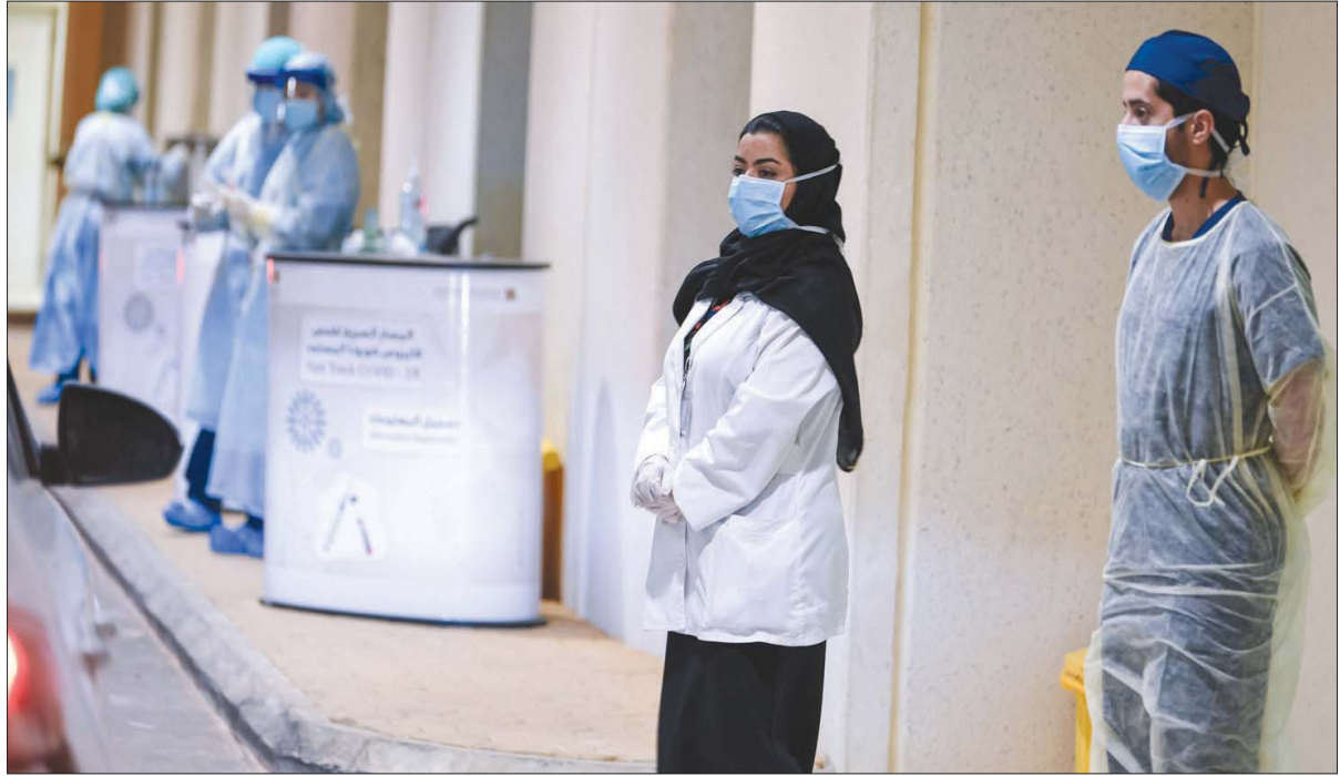
السعودية ستكون من أوائل الدول التي ستحصل على لقاح للفيروس