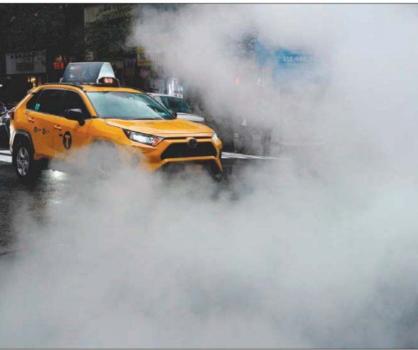
نسبة ثاني أكسيد الكربون في الجو سجلت ارتفاعاً كبيراً استمر في 2020 رغم وباء «كورونا»

كذلك فإن الأنواع الثلاثة الرئيسية من غازات الدفيئة المعروفة، أي ثاني أكسيد الكربون، وبممكن لثاني أكسيد الكربون الناجم خصوصاً عن استخدام الوقود الأحفوري وإنتاج الإسمنت وإزالة الأجرار، البقاء قروناً عدة في الغلاف الجوي، ولتفرات أطول في المحيطات. وزادت نسبة تركيزه في الغلاف الجوي بسرعة أكبر بين 2018 و 2019 مقارنة مع الزيادة المسجلة بين 2017 و 2018، أو مع معدل العشر الأخيرة. وفي النهاية، فإن مستوى ازدياد تركيز أكسيد النيتروز، وهو من غازات الدفيئة، وأيضاً منتج كيميائي يشكل خطراً على طبقة الأوزون، بقي عملياً مساوياً للمعدل المسجل للسنوات العشر الأخيرة، وتعود 40 في المائة من انبعاثات هذا النوع من غازات الدفيئة إلى الأنشطة البشرية (السمة واليات تحويل صناعي...)، فيما الباقي يأتي من مصادر طبيعية.