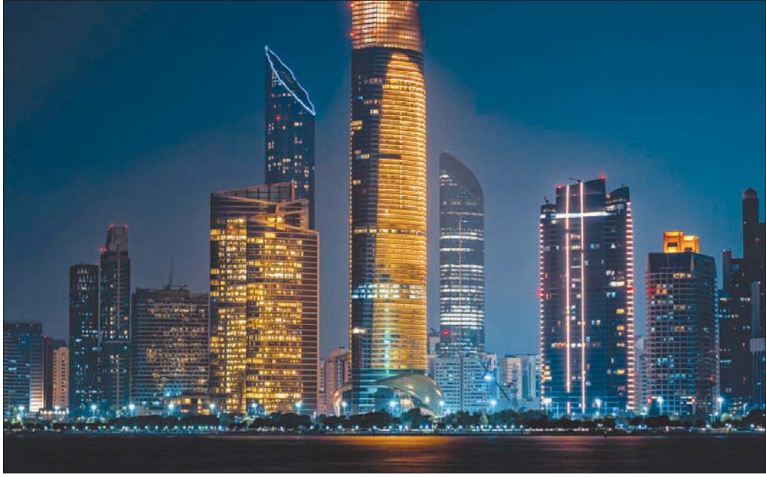
أبوظبي، الشرق الأوسط

تسعى الإمارات لتطوير البيئة التشريعية للقطاعات الاقتصادية في البلاد في خطوة لجذب الاستثمارات الأجنبية (الشرق الأوسط)