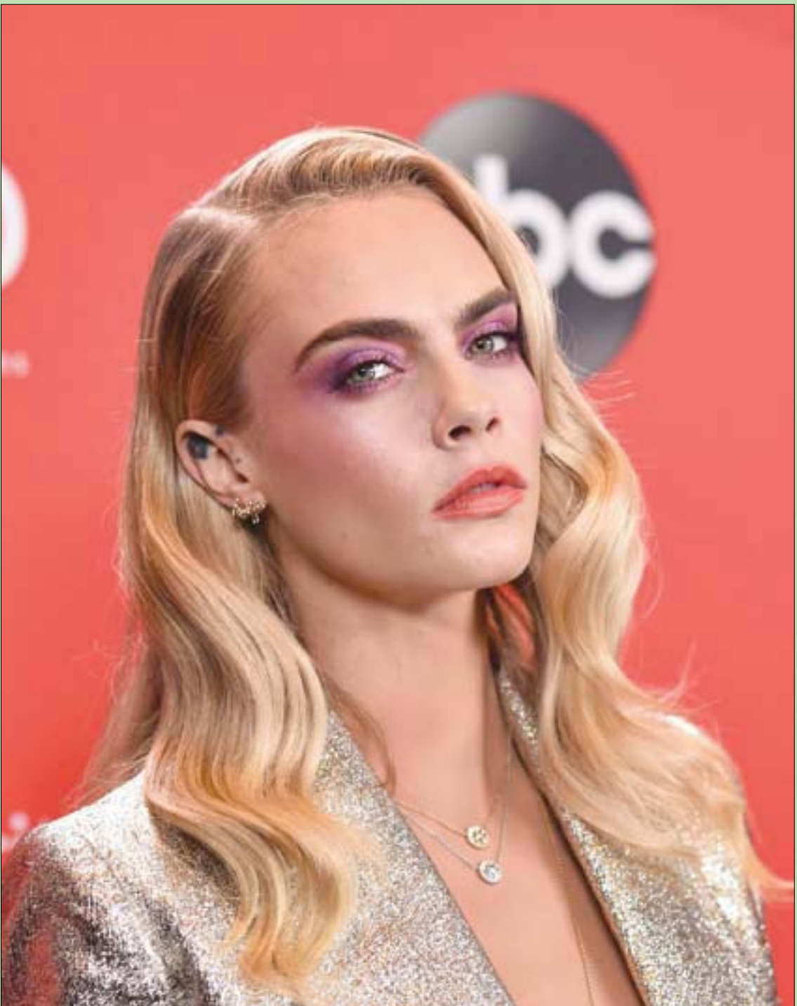
العارضة والممثلة البريطانية كارا ديلفين حضرت أمس حفل توزيع جوائز «أميركان ميوزيك» في لوس أنجلوس

أما اليوم ويا للأسف ضربت (الكاتبه) أضنانها، وتحولت شوارع بيروت إلى مكبات نفايات، و(أفرتقع) السياح والزوار، وكل ذلك كان بفضل (اتفاق القاهرة)، وكفل الناقص (حزب الله) العتيد (!!!) لك الله يا لبنان، أصبحت (تبكي عليك البواكي).