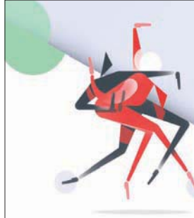
مهرجان بيروت للرقص المعاصر (بايبود)