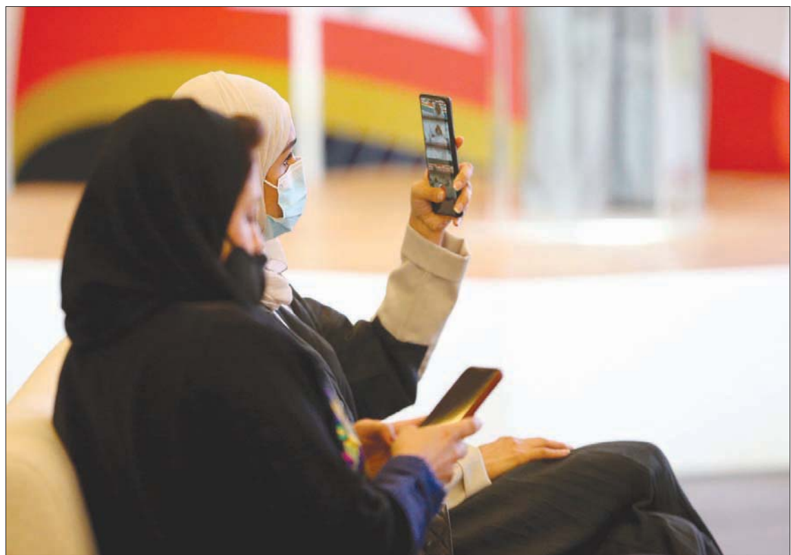
المرأة تسجل حضوراً طامغاً في أعمال ونتائج مجموعة العشرين برئاسة السعودية