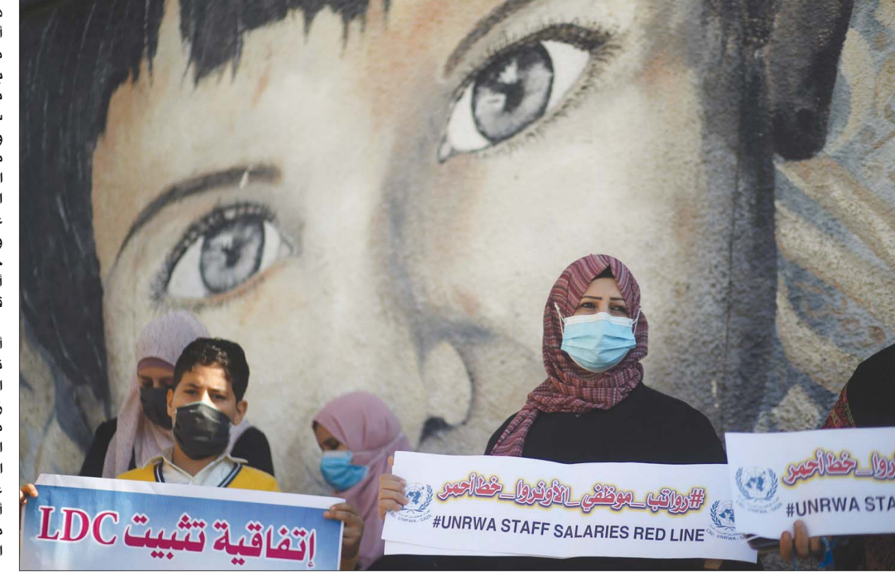
وقفة احتجاجية أمس لموظفي «الأونروا» بغزة احتجاجاً على خطة لخفض الرواتب

محتل بريد حريته، ويناضل من أجل الخلاص من الاحتلال. وأضاف «هناك اتفاقيات موقعة لم تكن إسرائيل تحترمها، ومرجحة العلاقة مع دولة الاحتلال لن تكون -لم تكن- «صفقة القرن» التي رفضناها، جملة وتفصيلاً». وتابع: «إن احترام إسرائيل للاتفاقيات الموقعة، بالسياسة لنا، يعني فتح مؤسسات القدس، وتشغيل الممر الآمن بين الضفة وغزة، وعودة موظفينا إلى الجسور كما في السابق، ووقف الاستيطان والاستيلاء على