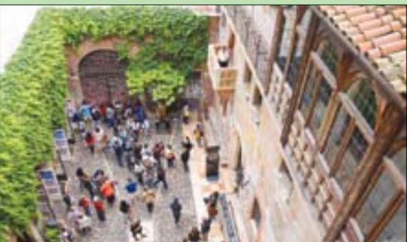
شرفة جولبيت في مدينة فيرونا الإيطالية

باتوكوه، «الشرق الأوسط» كان من الممكن التماس العذر لسائقي السيارات الماليزيين إذا اعتقدوا أنهم انصرفوا عن مسارهم إلى مدرج مطار، بعد أن هبطت طائرة صغيرة على طريق سريع مزدحم في جنوب البلاد. حسب وكالة الأنباء الألمانية. وقالت هيئة الطيران المدني الماليزية: «اضطرت طائرة خفيفة من طراز (بيتشركاف 35 يونانزا) للهبوط اضطرارياً على طريق سريع بالقرب من بلدة سيدناك،