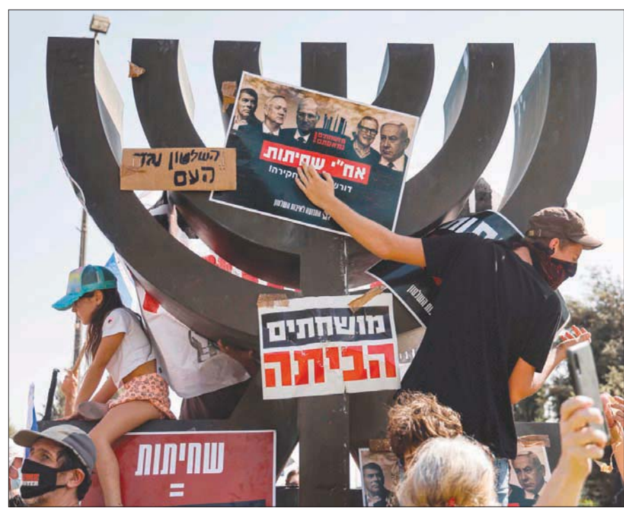
متظاهرون أمام الكنيست في سبتمبر يرفعون ملصقات معارضة للحكومة احتجاجاً على أفعالها

تل أبيب، نظير مجلي قرّر قرار القيادة السياسيين في إسرائيل، في الائتلاف الحاكم وفي المعارضة، على إجراء انتخابات جديدة، ستكون الرابعة خلال سنتين، وهذه المرة كانت «القشة» قرار رئيس حزب «كحول لغان» وزير الأمن، بني غانتس، تشكيل لجنة تقصي حقائق حول فضيحة الغواصات. فقد هاجمه رئيس الوزراء، بنيامين نتانياهو، وجميع قادة حزب الليكود الحاكم، واتهموه باستغلال الجيش لأغراض حزبية، فيما قال غانتس إن نتانياهو هو الذي يدفع إلى انتخابات. وقال رئيس المعارضة من حزب «يش عتيد تيلم»، يائير لبيد، إنه لا يصدق أن غانتس جاد في توجهه لتفكيك الحكومة، وطرح على الكنيست (البرلمان) مشروعاً لنزع الثقة عن الحكومة لاختبار مدى جدية، سيجري التداول فيه غداً الأربعاء. وكان غانتس قد ضرب عرض الحائط بطلبات نتانياهو الائتلاف عن تشكيل لجنة تحقيق حول موضوع الغواصات، وقال له: «لقد فحص الاستشار القضائي للحكومة، أياً، من مندليبت، هذا الملف من جميع جوانبه، وتوصل إلى الاستنتاج بأنه لا توجد قضية فساد يمكن محاكمة نتانياهو عليها في هذا الملف». لكن غانتس، الذي يتعرض لضغوط من قوى سياسية ومن قادة كبار سابقين