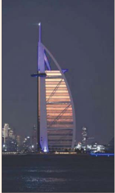
دبي، الشرق الأوسط

قال تحليل حكومي إن توسيع الإمارات لنطاق الإقامة الذهبية بشكل تدريجي، لتشمل مزيداً من الفئات، سيؤدي في واقع الأمر إلى تسريع وتيرة النمو الاقتصادي، وتحسين الإنتاجية في إمارة دبي، بالإضافة إلى تعزيز جاذبية الإمارة، بصفتها مكاناً مفضلاً للعيش والعمل.