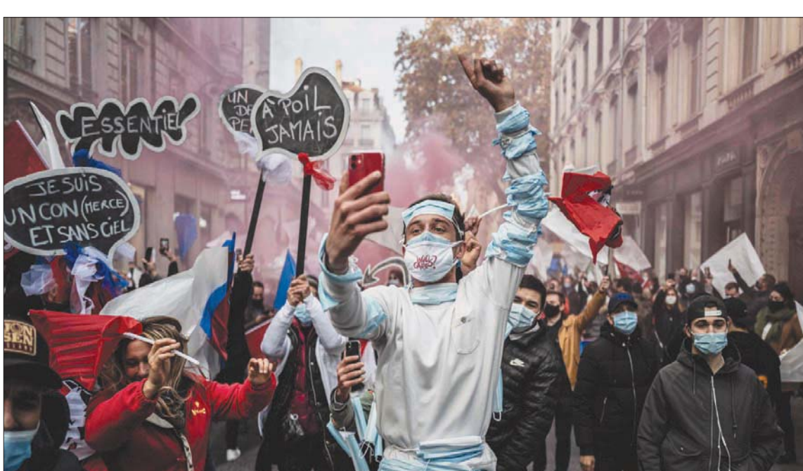
احتجاجات في عدد من المدن الأوروبية على قيود الإغلاق (أ.ب)

غرفة المريض بمساعدة الأشعة فوق البنفسجية. وسيتم تسليم هذه الروبوتات في غضون الأسابيع القليلة المقبلة، وسيتم الكشف قريباً عن قوائم المستشفيات المتلقية. على صعيد متصل، وفي التسارع من أجل التوصل للقاح مضاد لفيروس كورونا المستجد، قررت الحكومة