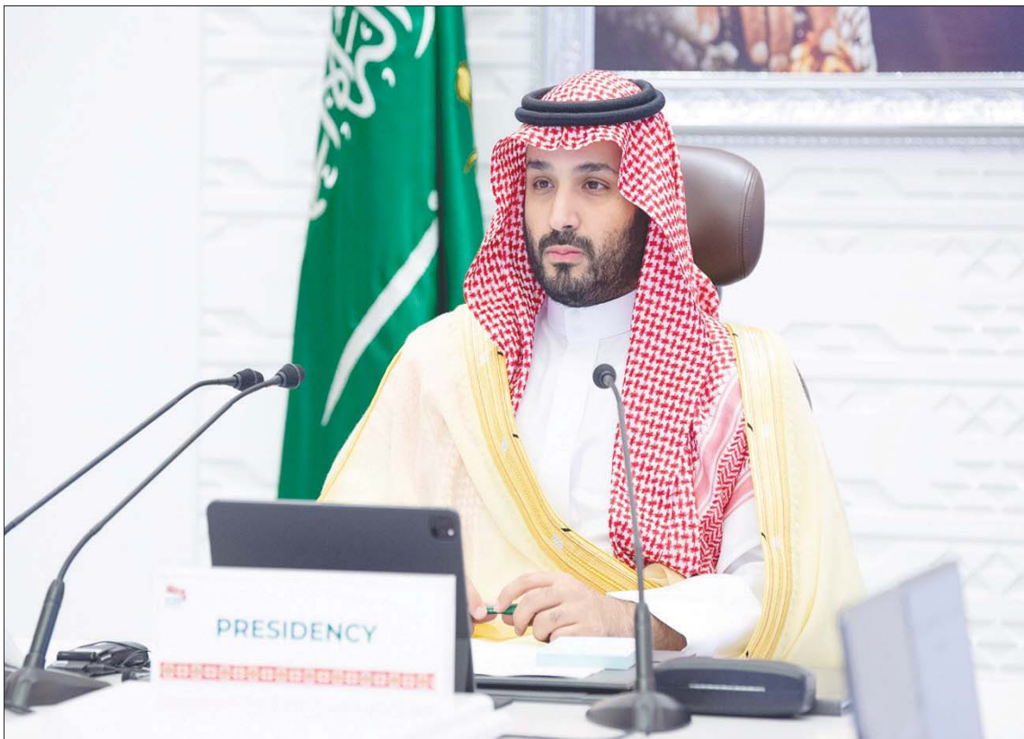
ولي العهد السعودي الأمير محمد بن سلمان يقدم مقترحاً بمقتضى عقدت مجموعة العشرين إبان انعقاد قمة القادة