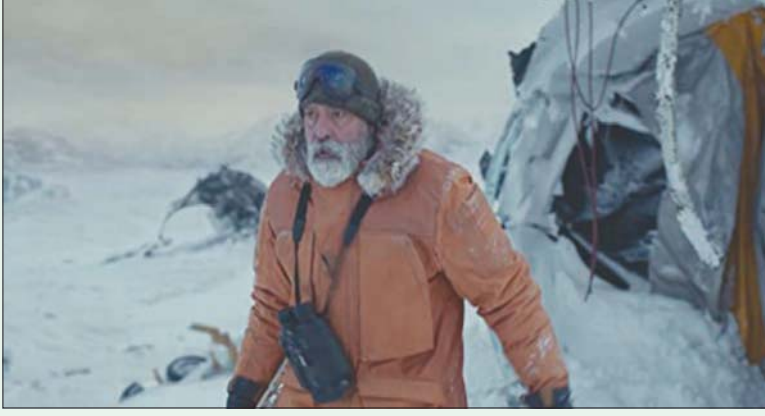
كلوني كما يبدو في «سماء منتصف الليل»

بالم سيرينغز؛ محمد رضا هناك العديد من الأحداث السينمائية التي تحتشد في شهر ديسمبر (كانون الأول) المقبل، وأحداهما الفيلم الجديد «سماء منتصف الليل (The Midnight Sky)» الذي تخاطب محطة «نكتيكس» لإطلاقه في الثالث والعشرين منه.