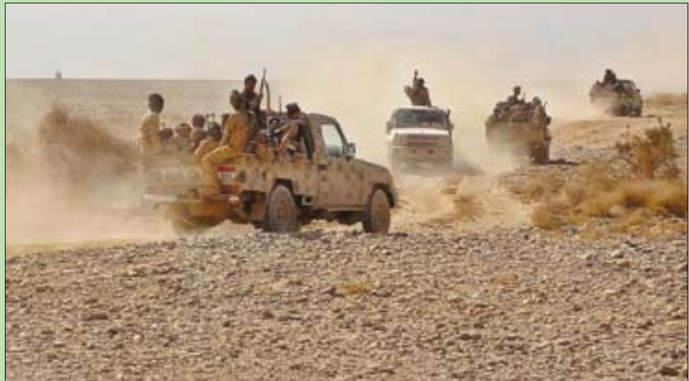
مقاتلون من الشرعية على إحدى جبهات القتال في مآرب (أ.ف.ب)