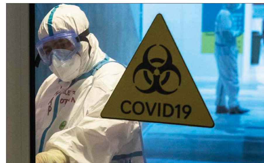
انتشار مراكز الفحص في كثير من مدن العالم