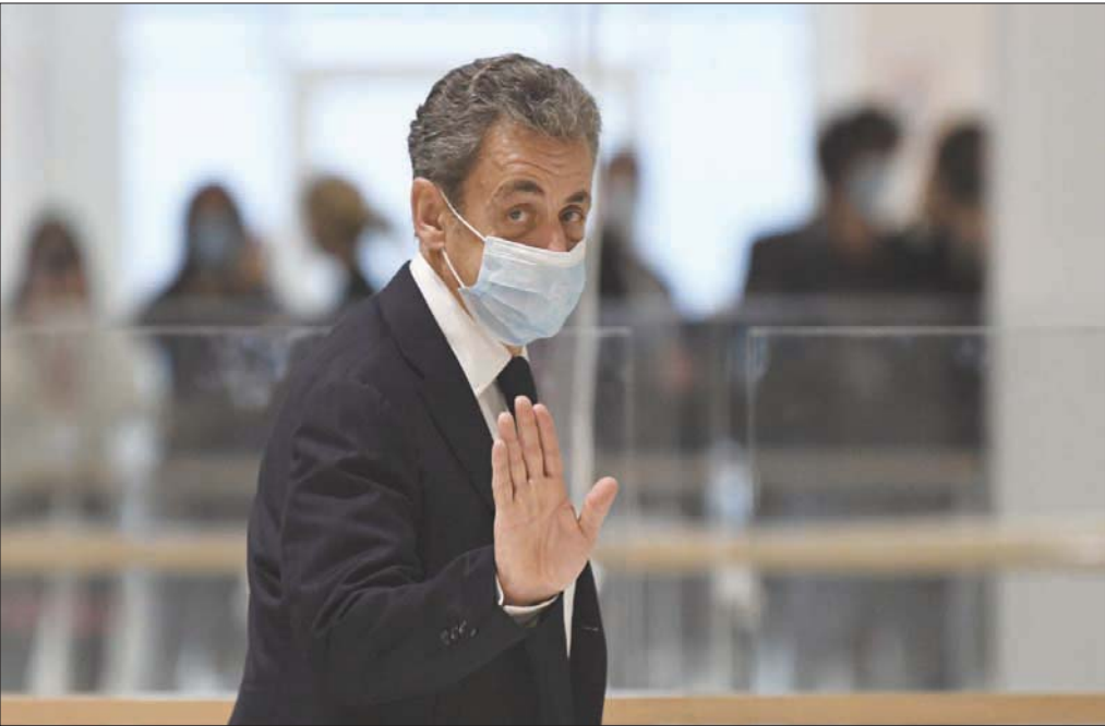
هناك دعوات لساركوزي للعودة إلى الميدان السياسي في المعركة الانتخابية التي ستحصل في 2022

تهمة الفساد واستغلال النفوذ. وتعرف هذه القضية باسم «التنصت»، لأن جلاءها حصل بمحض الصدفة. ذلك أن قاضي التحقيق، في الفترة تلك، كان منكباً على جلاء قضية أخرى تتعلق بحصول المرشح ساركوزي على هبات مالية من عائلة «بتنكور»، الضالعة في صناعة مستحضرات التجميل والعناية بالصحة. ولهذا الغرض، أمر المحقق بالتنصت لساركوزي على هاتف ساركوزي الجوال وهاتف محاميه آنذاك تيري هرتزوغ. وأفضت العملية إلى وجود شكوك لدى المحقق بوجود أرقام هواتف أخرى يتواصل عبرها الجرانل أن اكتشف أن الرجلين حقيقة يستخدمان هواتف أخرى، وأن لساركوزي اسماً مستعاراً هو بول بيسموت وهو رفيق مدرسة لهرتزوغ ويعيش في إسرائيل. والأهم أن التنصت كشف أن الثلاثة «مع جيلبير إيزيبي» بصد التامر لمساعدة العمولات المرتبطة بصفقة بيع غواصات لباكستان، والحبل على الجرار.