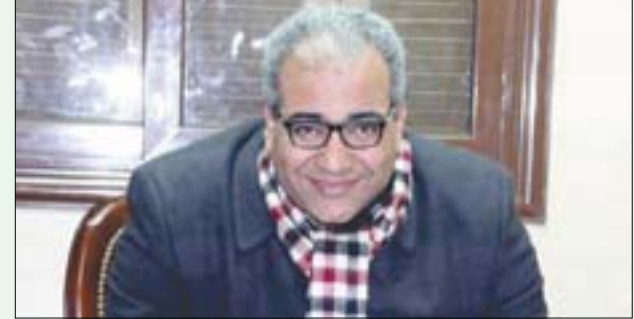
الفنان المصري بيومي فؤاد

القاهرة: محمود الرفاعي قال الفنان المصري بيومي فؤاد، إن ملامح وجهه الجادة تساعد كثيراً على تجسيد شخصيات متنوعة، ولا تحصره فقط في تقديم الأنماط الكوميديّة التي تائق بها خلال السنوات الماضية، وأكد في حوار مع «الشرق الأوسط» أن زوجته تطلب منه الضحك في المنزل أحياناً من جديته، عكس ما يعتقد البعض بسبب أدواره الكوميديّة المتعددة.