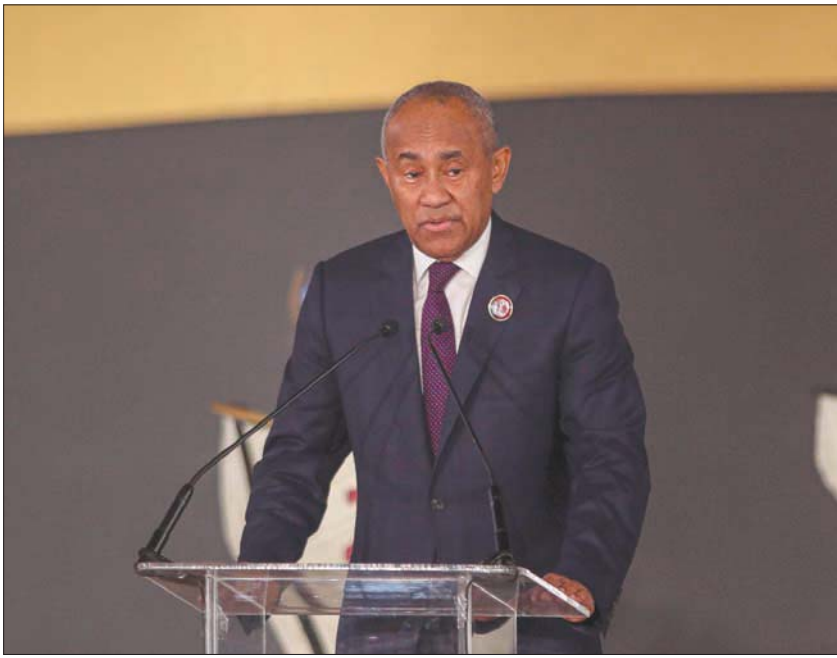
أحمد أحمد رئيس الاتحاد الأفريقي أمام مستقبل مظلم

المدرّب السابق ووزير الرياضة هدايا ومزايا أخرى، وإساءة إدارة الأموال واستغلال منصبه كرئيس للاتحاد القاري، ولذا ووفقاً لقواعد الأخلاقيات في الفيفا جاء قرار وقفه عن كل نشاط كروي (إداري، رياضي وغيره) محلياً ودولياً أكبر مع شركة «تاكتيكال ستيل» التي تتخذ من فرنسا مقراً لها. ورأى القضاء الداخلي في الفيفا، أن أحمد، نائب رئيس الاتحاد الدولي، ارتكب عدة مخالفات في إدارة الاتحاد الأفريقي بين 2017 و2019، «بينها تنظيم وتمويل رحلة حج إلى مكة، واستغلال علاقته مع شركة الأجهزة الرياضية تاكتيكال ستيل وأنشطة أخرى».