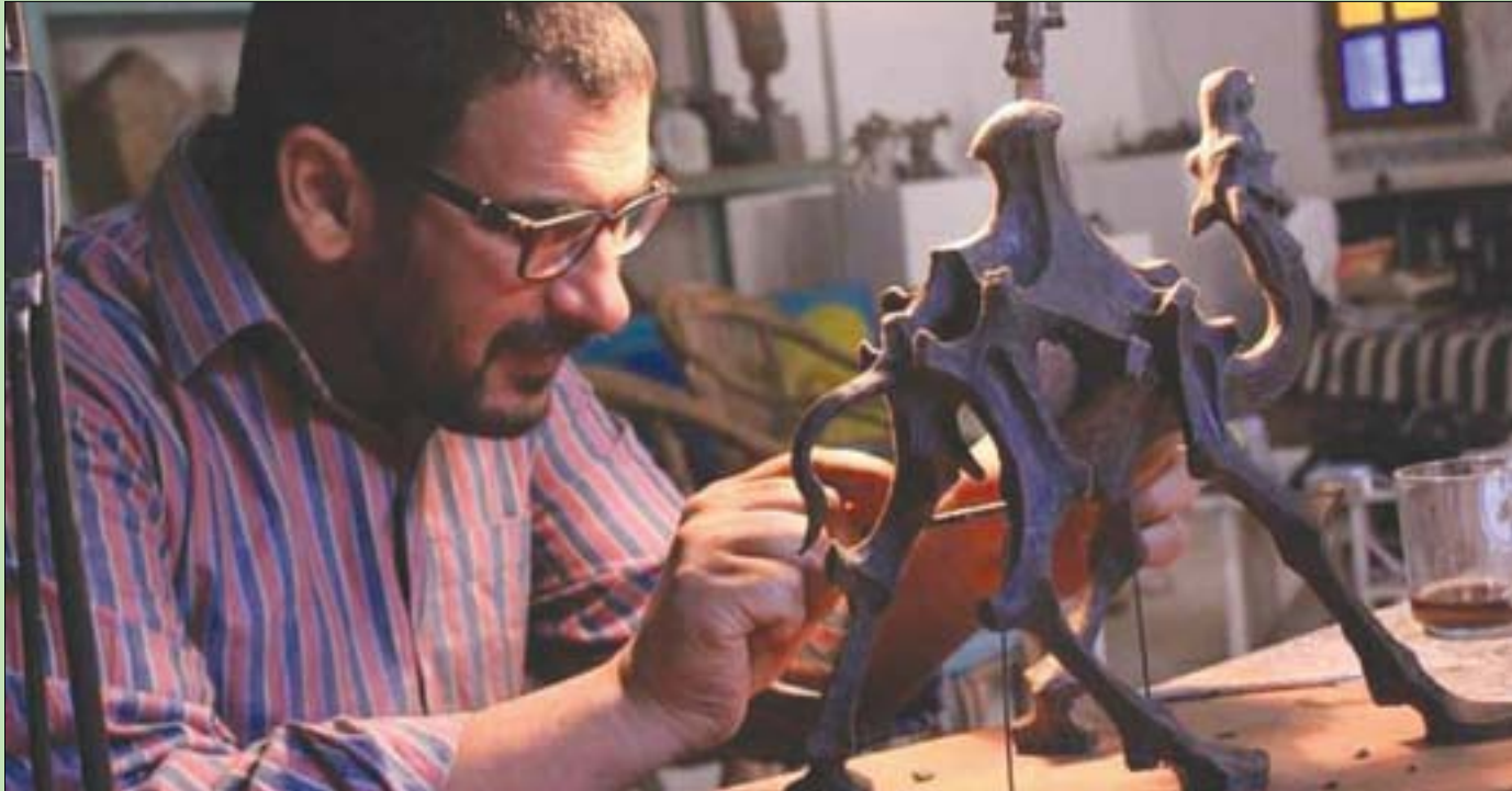
الفنان المصري Nathan دوس (الشرق الأوسط)