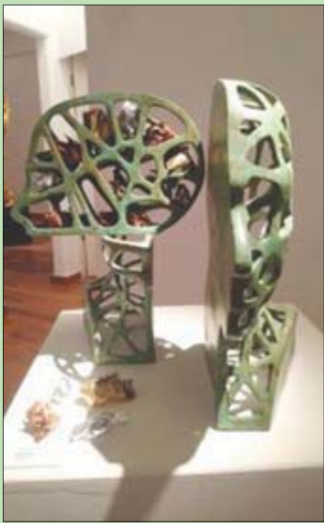
جانبا من معرض «أيديولوجيات»