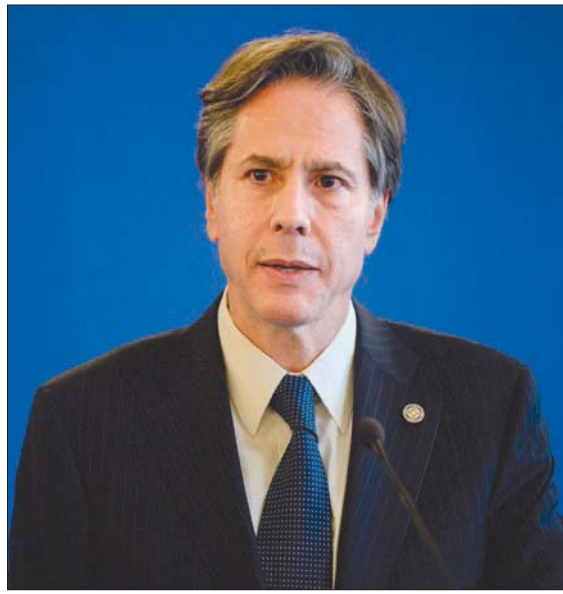
أنتوني بليكن

كان بايدن قد تعهد أن يعمل «من كل قلبه» لنيل ثقة «الشعب الأمريكي»، وبإشراك الاستعدادات