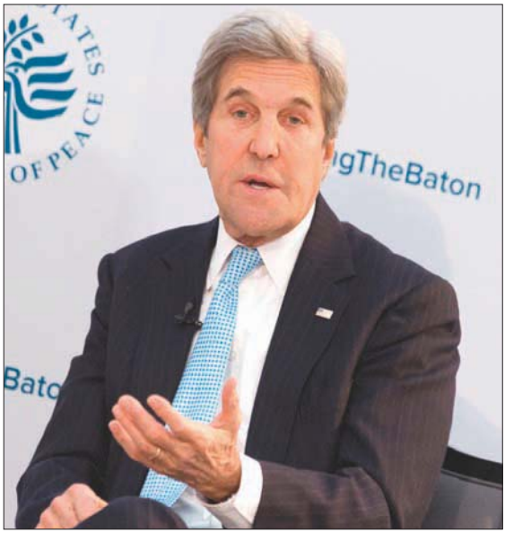
جون كيري

مدار العقود الماضية من حيث كيفية تعامل الولايات المتحدة والصين معها». ويرجع أن يقوم بايدن بتسمية وزراء ومرشحين لمنصب عليا رفيعة، مثل الاقتصاد، أو الأمن القومي، أو الصحة العامة. رفاد مستشارو العملية الانتقالية للرئيس المنتخب بأنه سيصدر التعيينات، في يوليوي (تموز) الماضي: «علينا أن نتخلص أولاً من العجز الاستراتيجي الذي وضعنا الرئيس ترمب فيه»، لأنه ساعد الصين على تحقيق أهدافها الاستراتيجية الرئيسية، مضيفاً أن بايدن سيعزز الدفاعات البيئية في تايوان من خلال فضح جهود بكين للتدخل الفارقة هي أن تايوان كانت قصة نجاح على