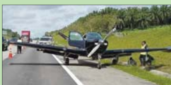
الطائرة بعد هبوطها على طريق سريع جنوب ماليزيا

باتوكوه، «الشرق الأوسط» كان من الممكن التماس العذر لسائقي السيارات الماليزيين إذا اعتقدوا أنهم انصرفوا عن مسارهم إلى مدرج مطار، بعد أن هبطت طائرة صغيرة على طريق سريع مزدحم في جنوب البلاد. حسب وكالة الأنباء الألمانية. وقالت هيئة الطيران المدني الماليزية: «اضطرت طائرة خفيفة من طراز (بيتشركاف 35 يونانزا) للهبوط اضطرارياً على طريق سريع بالقرب من بلدة سيدناك،