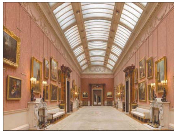
صالة عرض اللوحات الفنية «بيكتشر غاليري» (رويال كوليكتشن)

المعرض في «كويينز غاليري»، المعنون «روائع من قصر باكنغهام»، يضم 65 لوحة كانت معروضة في «بيكتشر غاليري» في القصر، وهي المرة الأولى التي تعرض اللوحات في معرض مفتوح للجمهور