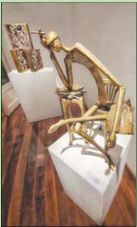
ينحت شخصه بأحجام صغيرة توفيراً للتكلفة