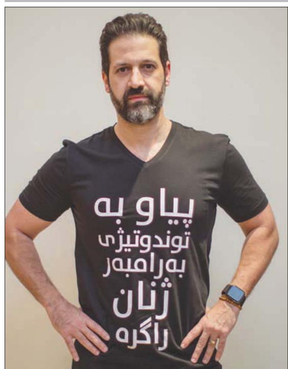
نائب رئيس كردستان يرتدي قميصاً عليه شعار ضد العنف بحق النساء.