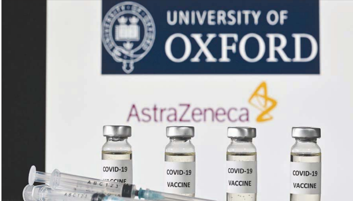
اللقاح الذي تطويره جامعة أكسفورد البريطانية

وأودى الوباء بحياة ما لا يقل عن 1,388,590 شخصاً في أنحاء العالم منذ أن أعلن مكتب منظمة الصحة العالمية في الصين عن ظهور المرض، وفقاً لتقرير أعدته