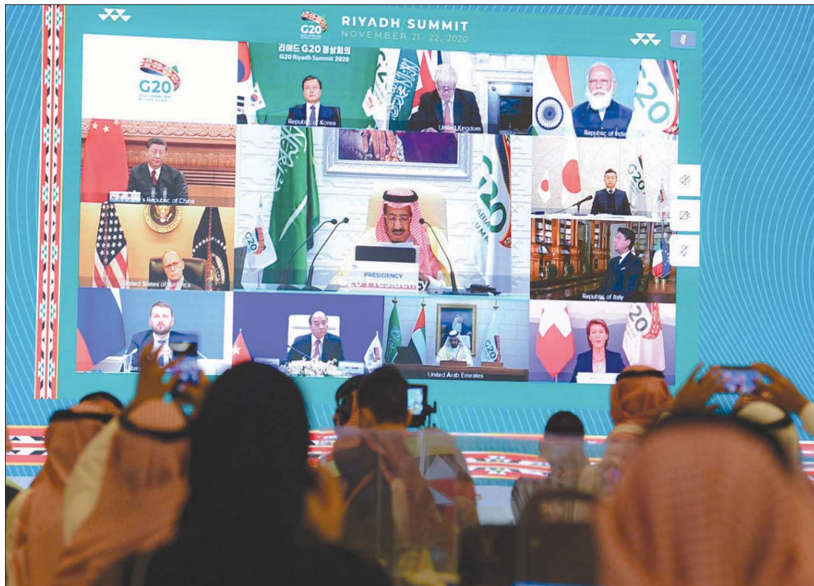
خادم الحرمين الشريفين لدى ترؤسه الجلسة الختامية لقمة قادة مجموعة العشرين افتراضياً أول من أمس

الرقمي الإدارة الرقمية، والصحة الرقمية هي خيار العالم في الأعوام المقبلة، ومن لم يلتحق سيكون متخلفاً عن العالم. وأسار الرقاع، إلى أن الذين يعملون ضد التنمية على مستوى العالم يهجمون الإلكتروني لتعطيلها أو تعرضت القمة للملوثي هجوم الإلكتروني نجحت في إدارة القمة الافتراضية العالمية، وإفشل هذه الهجمات الإلكترونية بسواعد الشباب السعودي.