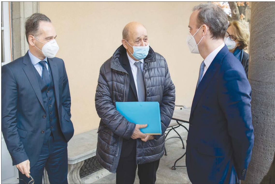
وزير الخارجية الفرنسي جان إيف لودريان يتحدث إلى نظيره البريطاني دومينيك راب والمانى هايكو ماس على هامش لقاء في برلين أمس

ليبايدن أن المرشحين الأساسيين للوزارات الخارجية: 1 - كريس كوزن، السيناتور الذي يعارض الاتفاق النووي ويتخفق مع ترمب ولم يفتتح إلا بضغوط من الديمقراطيين، 2 - توني بليكن: عارض في المداية الضغوط القصوى لترمب، لكنه دافع مؤخراً عن ترمب واعتبر أنه ترك رأسمالاً جيداً لنا».