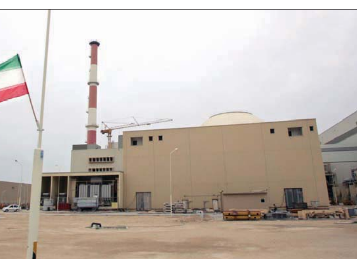
منشأة بوشهر النووية الإيرانية

مهام منصبه الجديد، على نحو ما أفاد به مسؤولون أميركيون ودبلوماسيون أوروبيون وخبراء إقليمي في الآونة الأخيرة. كان الرئيس الإيراني حسن روحاني، قد التقى بجُلّ ثقله السياسي وراء الاتفاق النووي لعام 2015، المعروف باسم «خطة العمل الشاملة المشتركة»، لكن ليست هناك من ضمانات واضحة بأن الرئيس الإيراني المقبل سوف يكون منفتحاً على إبرام صفقات أو عقد اتفاقيات جديدة في هذه القضايا. وقال مسؤولون أميركيون بارزون، إنه ينبغي على بايدن أن يتعامل المباشر مع الصقور المعارضة بشدة للاتفاق النووي في كل من واشنطن وطهران، على حد سواء، وكذلك في منطقة الشرق الأوسط، كما سوف يحتاج كل منهما إلى التأكيد على أي تنازلات تتخذ من أي جانب سوف تقابلها إجراءات منخدة على أرض الواقع