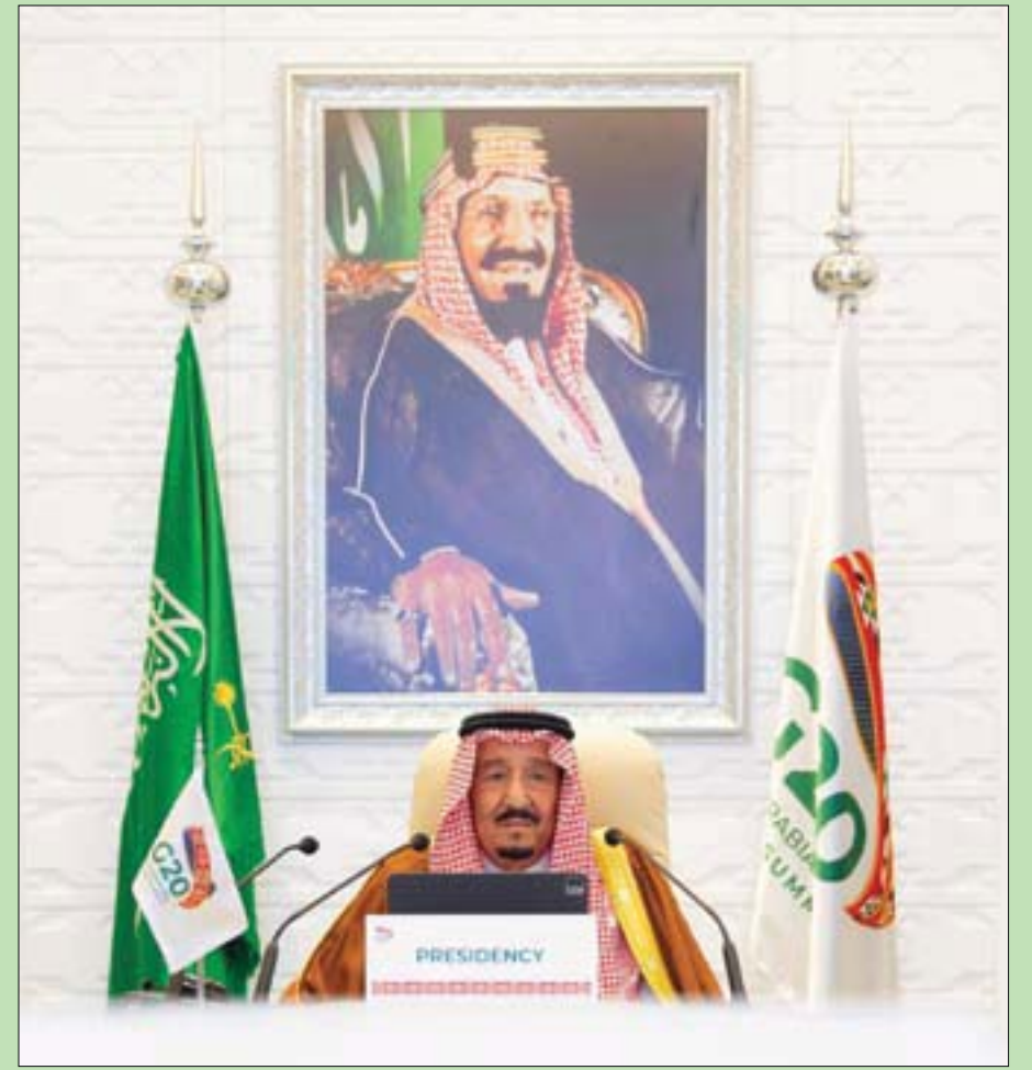
خادم الحرمين الشريفين لدى افتتاحه قمة قادة «مجموعة العشرين» أمس (الشرق الأوسط)

بالتغير المناخي وضمان إيجاد أنظمة طاقة أنظف وأكثر استدامة وأيسر تكلفة... علينا قيادة المجتمع الدولي في الحفاظ على البيئة وحمايتها». وأضاف «في هذا السياق، فإننا ندعو إلى مكافحة تدهور الأراضي والحفاظ على الشعب المرجانية والتنوع الحيوي مما يعطي مؤشراً قوياً على التزامنا بالحفاظ على كوكب الأرض». وأكد الملك سلمان في الكلمة لإدراكنا أن التجارة محرك أساسي لتعافي اقتصاداتنا، فقد قمنا بإقرار مبادرة الرياض بشأن مستقبل منظمة التجارة العالمية، بهدف جعل النظام التجاري المتعدد الأطراف أكثر قدرة على مواجهة التحديات الحالية والمستقبلية».