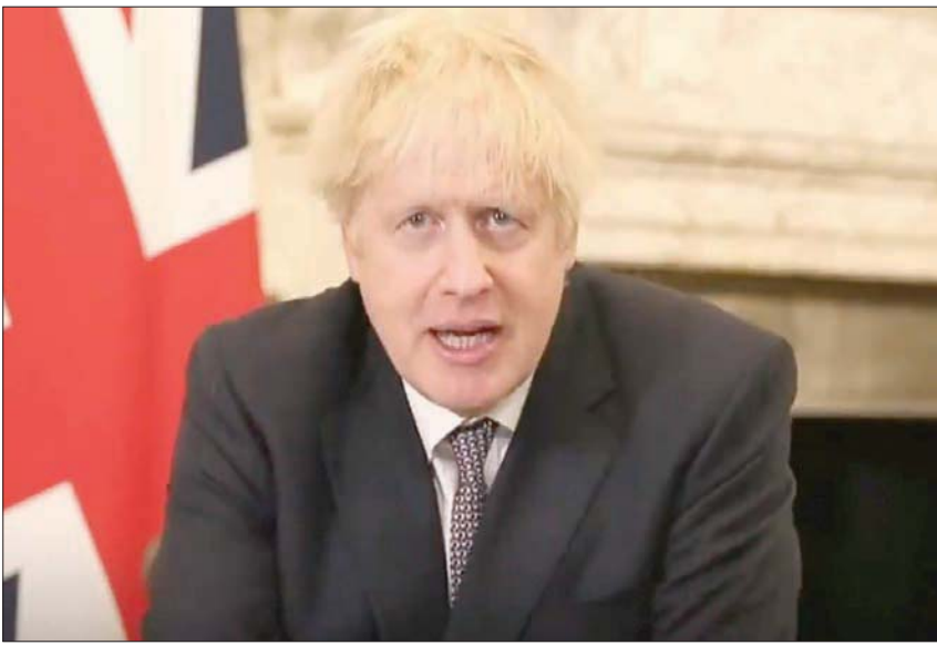
رئيس وزراء بريطانيا بوريس جونسون أثناء لقاء كلمته أمس

والاستقرار لاقترادنا ولكل شعوب الأرض». وفي كلمته، أشار الشيخ محمد بن راشد آل مكتوم نائب رئيس دولة رئيس مجلس الوزراء حاكم دبي، إلى أن العالم يعيش اليوم مرحلة استثنائية تترقب فيها الشعوب انتهاء الأزمة، الأمر الذي يؤكد أهمية العمل الجماعي والتعاون الدولي، ليس فقط للخروج من هذه الأزمة بأسرع وقت ممكن، بل وبأقل الخسائر.