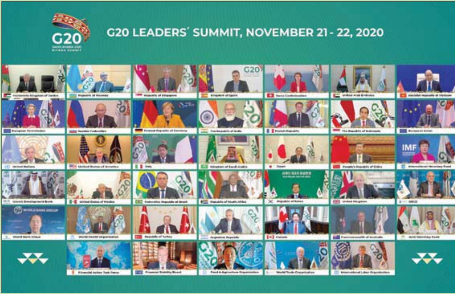
صورة جماعية لقادة «مجموعة العشرين» والدول والمنظمات المدعوة أمس