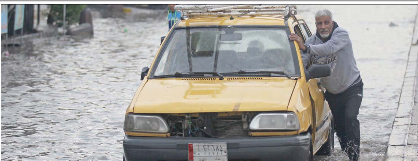
عراقي يدفع بسيارته التي تعطلت في شارع غمرته مياه الأمطار في بغداد أمس