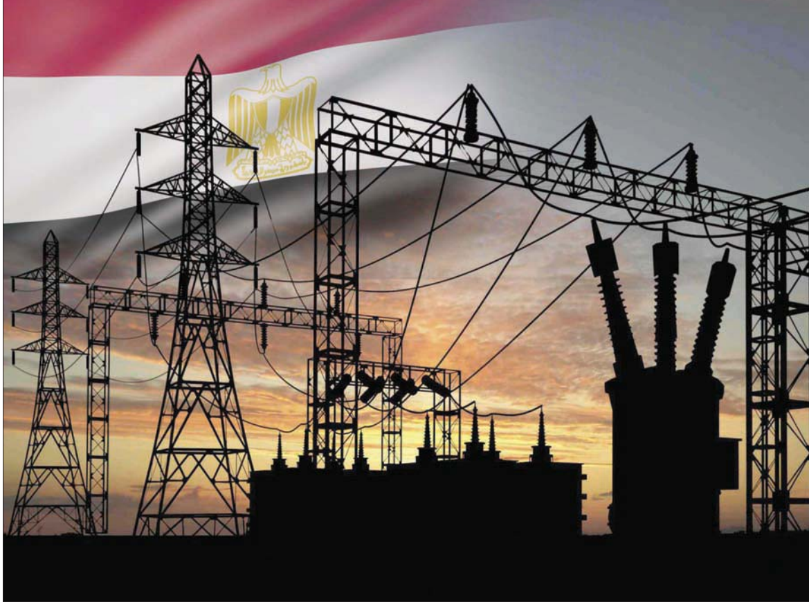
مصر تستطيع إنشاء خطوط الربط الكهربائي مع دول أفريقيا وأوروبا والخليج (الشرق الأوسط)

لحين انتهاء هذه الأزمة. ولجئت إلى أنه على الرغم من الظروف التي يمر بها العالم حالياً، إلا أن قطاع الطاقة يسير في طريقه نحو تعديل مزيج الطاقة، وتعزيز نصيب الطاقة المتجددة في هذا المزيج بما يحقق استدامة الطاقة وأمنها، والتنمية المستدامة في مصر.