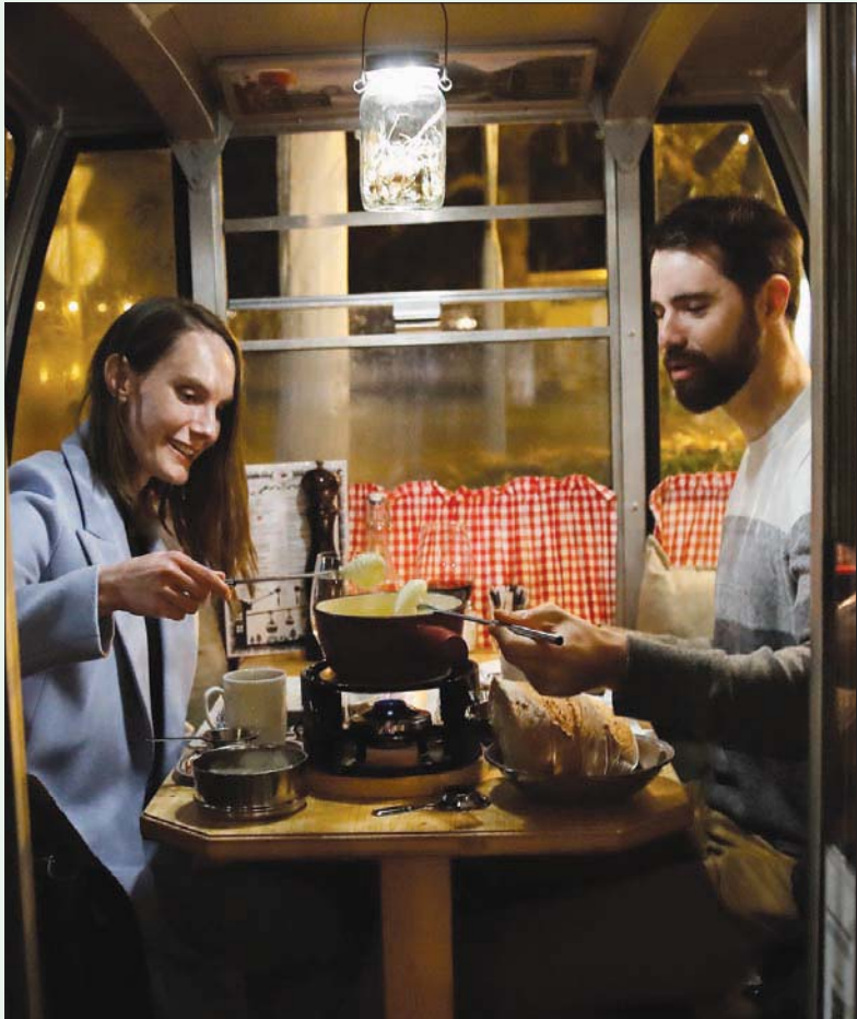
طبق الفونديو الوطني السويسري