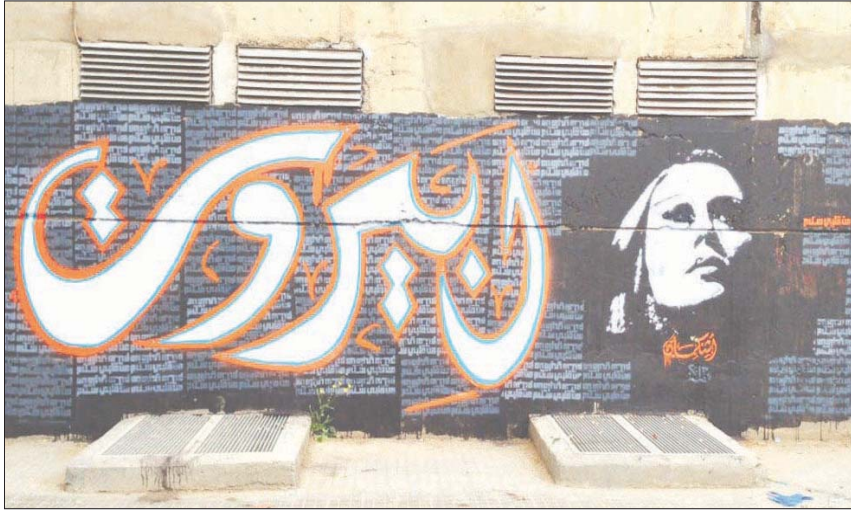
جدارية فريق أشكمان التي زينت بيروت منذ عام 2013

ستبقى طي الكتمان، ولن يرى أحد شريطاً مصوراً في أي وقت مقبل، حسب ربما الرحباني ابنة فيروز، لأنها أدارت زر الكاميرا، لتسجل تلك اللحظات التاريخية وذهبت لاستقبال ماكرون عند وصوله، وبعد