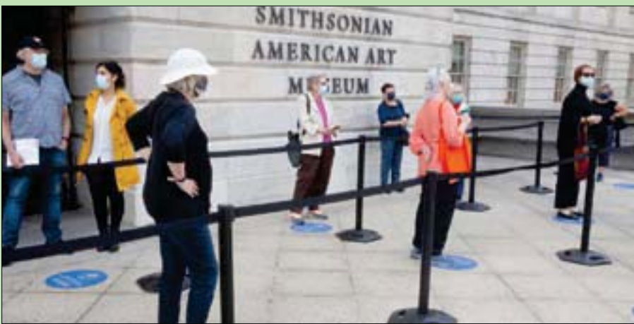
زوار متحف الفنون الأميركية عندما أعيد افتتاحه في سبتمبر الماضي

والفضائي في مدينة سانتبيلي بولاية فيرجينيا، اعتباراً من 24 يوليو (تموز) من العام الحالي. واستبعدت ذلك افتتاح أبواب