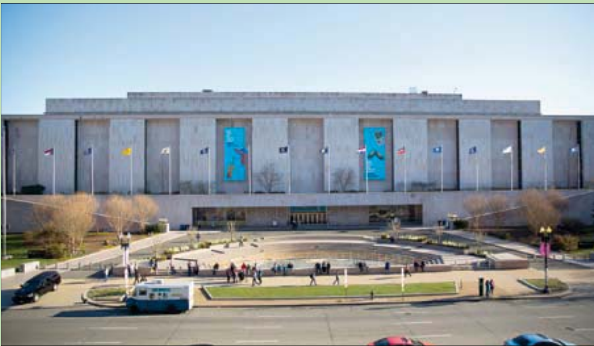
متحف «سميثسونيان» للتاريخ الأمريكي في واشنطن