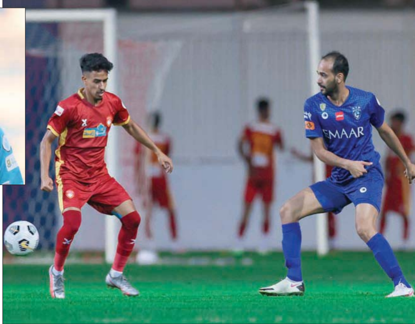
من المواجهة الودية الأخيرة التي خاضها الهلال أمام ضمك

الماضي؛ حيث يتصدر الفريق العصامي لائحة ترتيب الدوري برصيد عشر نقاط، وهو الرقم ذاته الذي يملكه فريق الشباب ويتقاسم معه الصدارة. وعلى صعيد لقاءات الديربي، قاد الروماني رازقان فريقه الهلال في مباراتين أمام غريمه التقليدي النصر، وذلك في الموسم الماضي؛ حيث خسر مباراته الأولى بهدفين لهدف في المباراة التي جمعت بينهما على ملعب جامعة الملك سعود، أما في ثاني المواجهات فقد نجح لوشيسكو في قيادة