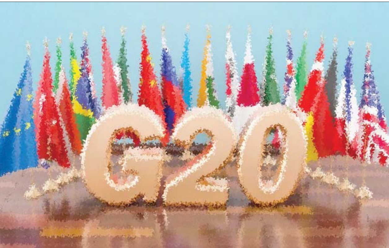
* بالاتفاق مع «بليوميرغ»

دا سيلفا - في صورة أكثر إنصافاً ضمن المجلس الأعلى للحكومة الاقتصادية العالمية. وعلى الرغم من بعض المعارضة الصادرة عن الجانب الفرنسي والألماني، فإنهم خرجوا بصفقة استثنائية؛ تريليون دولار من الطاقة الاستيعابية الجديدة لصندوق النقد الدولي، منها 250 مليار دولار من التمويل الجديد من أعضاء المجموعة، ونصف تريليون دولار في «تدابير الاقتراض الجديدة»، و250 مليار دولار أخرى من حقوق السحب الخاصة الإضافية - وهي الأداة شبه النقدية التي أتحت لأعضاء صندوق النقد الدولي على أساس نسبي. وصار التدخل الاقتصادي من المستوى الدولي على نطاق مماثل من الأمور الأكثر إلحاحاً في الأونة الراهنة. فلقد دخلت أغلب الدول الأعضاء في مجموعة العشرين الدولية في خضم الموجة الثانية من وباء فيروس «كورونا المستجد»، مع نطاق أوسع من حالات الإصابة المؤكدة بصفة يومية، في ظل تهاوي الائتال العام لقرارات الإغلاق والتدابير الاحترازية، نظراً لعجز مختلف الحكومات عن حشد الإرادة الكافية لاحتواء تفشي الفيروس المتجدد.