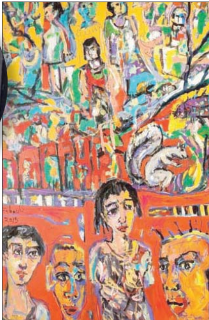
لوحات المعرض تبدو كحكاية سردية متكاملة

وتقف مجسمات النحت البرونزية في المعرض في وضعيات حركية وكأنها خرجت لتوها من اللوحات بكل تفاصيلها المتحركة، فالبشر في لوحاته، رغم ملامحه المجردة، في حالة وصل، وحميمية، وشغف بالجمال والموسيقى، وكأنها شذرات من أحلام ما، أو قيس من حياة نوستالجية موازية.