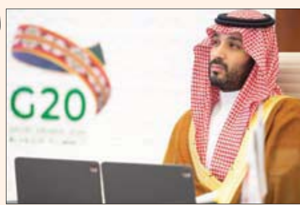
الأمير محمد بن سلمان خلال فعاليات القمة

الاجتماعات عبر فضاءات الاتصالات، التي أسست لها الهيئة السعودية للبيانات والذكاء الصناعي، وهي الهيئة التي يرأس مجلس إدارتها الأمير محمد، حيث برهنت البلاد على محورية الحضور في القرار العالمي ببصمة التميز في إقامة الاجتماعات ومجموعة التواصل، فربطت عبر