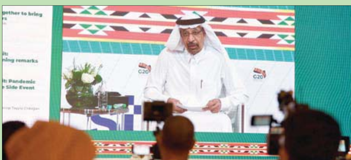
قمة قادة «العشرين» برئاسة السعودية تنعقد افتراضياً لأول مرة في تاريخها

وأشار الفالح إلى أن كل ما يمر به العالم لا سيما في ظروف جائحة كورونا يحتم تضافر الجهود بين دول العالم لمقاومة هذه الظروف، بينها ما