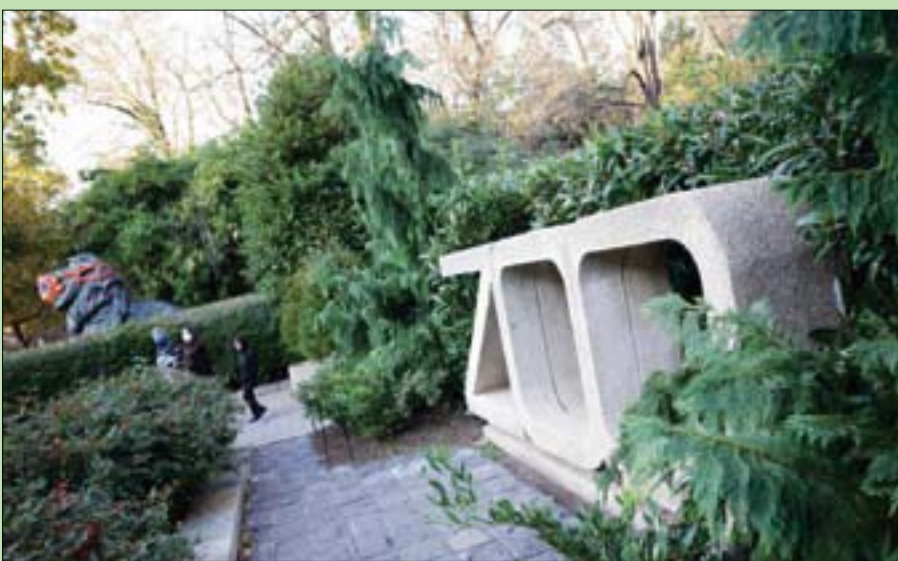
حديقة حيوان «سميثسونيان» الوطنية في العاصمة واشنطن