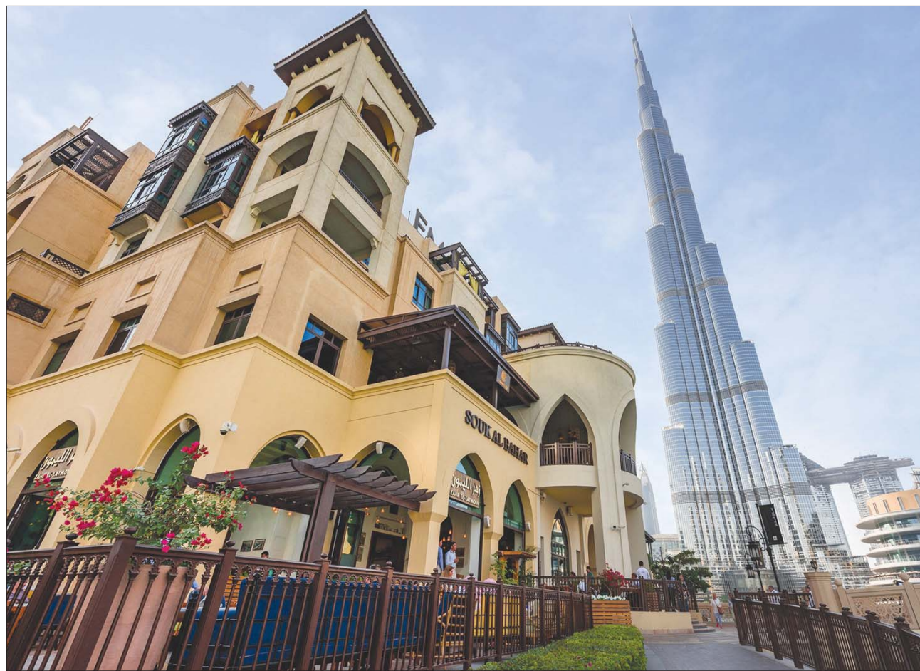
سوق البحار في دبي سيكون عنوان الفرع الأول لـ«تايم أوت ماركت» في الشرق الأوسط