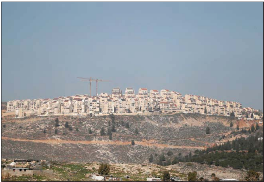
مستوطنة «بسغوت» الإسرائيلية على جبل الطويل

جميع الخطط الحساسة إلى مكتب رئاسة الوزراء، ما منع الموافقة عليها. لكن مع دخول رصات شلومو، ما تسبب في غضب بايدن وكبار المسؤولين في إدارة أوباما، بسبب اعتبارهم ما جرى ضربة لبائدين الذي كان يحاول دفع استئناف المحادثات السياسية مع الفلسطينيين. وادت تلك الخطوة إلى أزمة دبلوماسية حادة مع الولايات المتحدة، وتوقف حينها البناء الأخضر في القدس، وتم نقل