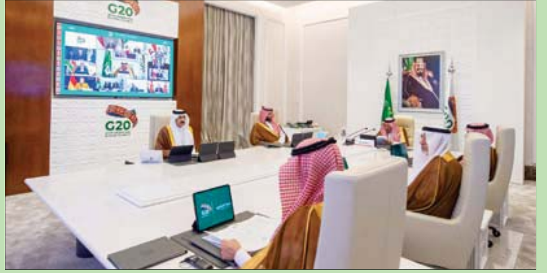
خادم الحرمين الشريفين يفتتح القمة بخطاب ويبدو ولي العهد الأمير محمد بن سلمان... وقادة مجموعة العشرين يستمعون لكلمة الملك سلمان بن عبد العزيز

● السعودية تدعو إلى عمل دولي مشترك لصد الأوبئة (ص 3)