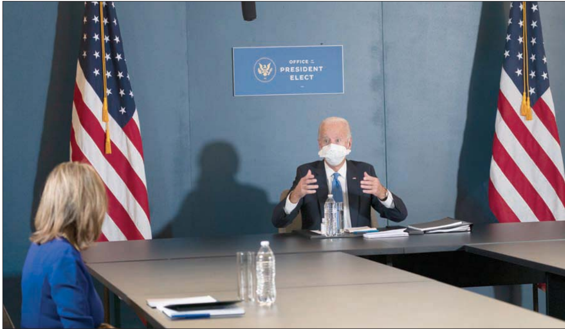
بايدن ويبلوسي لدى لقاء في ويلمينغتون في ولاية ديلاوير الجمعة

نيويورك، علي بردي واصل الرئيس الأمريكي المنتخب جو بايدن جهوده للانتقال في 20 يناير (كانون الثاني) المقبل إلى البيت الأبيض، موسعاً في الوقت ذاته فارق فوزه إلى أكثر من ستة ملايين صوت عن منافسه الرئيس دونالد ترмп الذي لا يزال يقود حملة لا هوادة معتبراً أنها «مزورة» ورافضاً الإقرار بهزيمة.