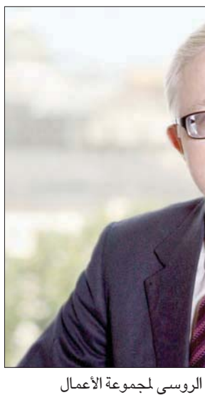
الكسندر شوخين الشربا الروسي لمجموعة الأعمال

القرارات». وحيال الخطة المتوقعة للاستفادة من نتائج قمة العشرين في المشاريع السعودية الروسية المشتركة، وفق شوخين، تكمن أهمية المؤسسات المتعددة الأطراف للتعاون الدولي، مثل مجموعة دول العشرين، في تقليل مخاطر السياسات غير المناسبة وفوائد أحادية الجانب، مشيراً إلى أنه في الوقت نفسه، من المستحيل المبالغة في تقدير دور هذه المؤسسات في وضع القواعد الشاملة للتنمية المستدامة لكل عضو في المجتمع الدولي، بما في ذلك المملكة العربية السعودية وروسيا أيضاً.