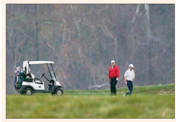
الرئيس ترمب يمارس رياضة الغولف في فرجينيا أمس

الذي يواصل تأكيد انتصاره والرزم أن فوز منافسه جو بايدن سببه تزوير واسع النطاق، دون أن يقدم أدلة على ذلك. من جهته، لا يستعمل جو بايدن «تويتر» بالقدر نفسه، إذ نشر أقل من 7 آلاف تغريدة لمشاركته الذين يبلغ عددهم 19 مليوناً، مقابل 58 ألف تغريدة نشرها ترμπ.