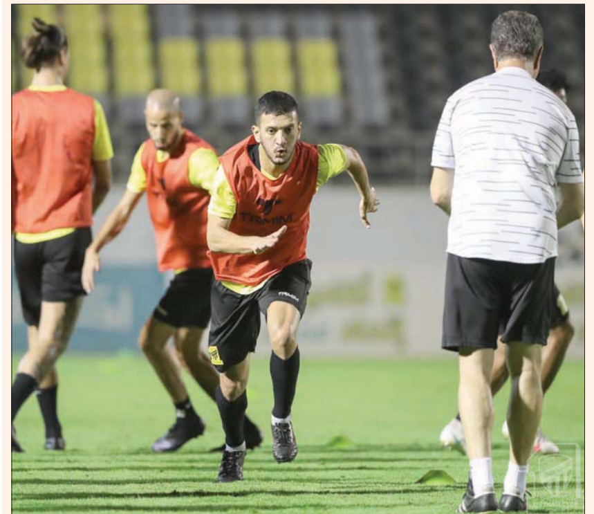
لاعب الاتحاد خلال تدريباتهم على ملعب النادي بجدة

الجيد لأولى مواجهات الفريق الرسمية مع عودة المنافسات الرياضية المجددة بعد التوقف لـ«أيام الفيفا» أمام الفيصلي، ضمن منافسات الجولة الخامسة لدوري كأس الأمير محمد بن سلمان للمحترفين. وحصدت بعثة الاتحاد، أمس، رحالها في العاصمة الرياض ومنها إلى الجمعية، تاهياً للمواجهة التي يتطلع الاتحاديون من خلالها للعودة بنقاط المباراة الثلاث إلى معقلهم بجدة وجادة الانتصارات التي اقتطعتها الفريق بنسبة أكبر مع انطلاق منافسات الدوري السعودي للمحترفين، حيث لم يحقق الانتصار سوى في مواجهة واحدة أمام الغريم التقليدي الأهلي من أصل أربع مباريات خاضها، وحقق التعادل في اثنتين مع الفتح والتعاون، وخسر واحدة أمام الاتفاق، ليحتل المركز العاشر في سلم الترتيب برصيد 5 نقاط.