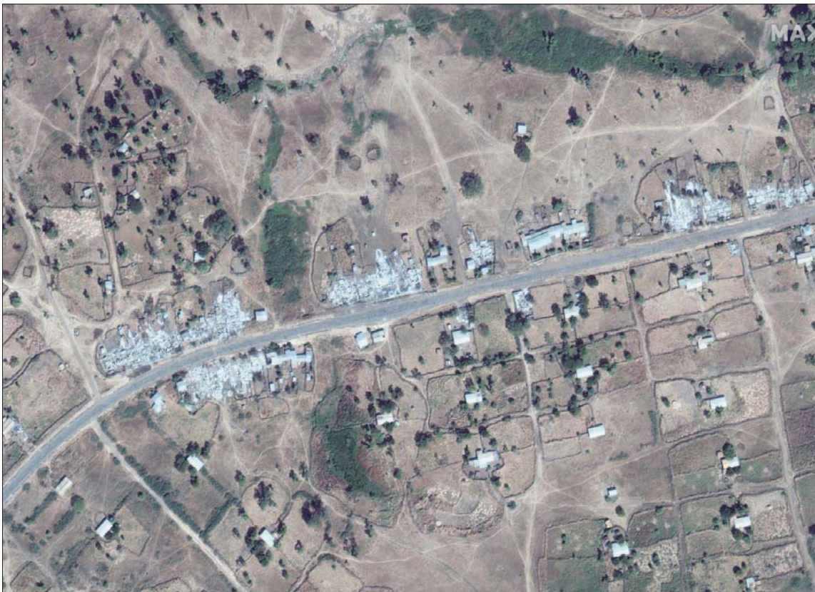
يظهر الدمار في صور الأقمار الصناعية التي قدمتها شركة الفضاء التجارية «ماكسار تكنولوجياز»

أبي أحمد يرفض وساطة الاتحاد الأفريقي ويتمسك بحسم التمرد عسكرياً