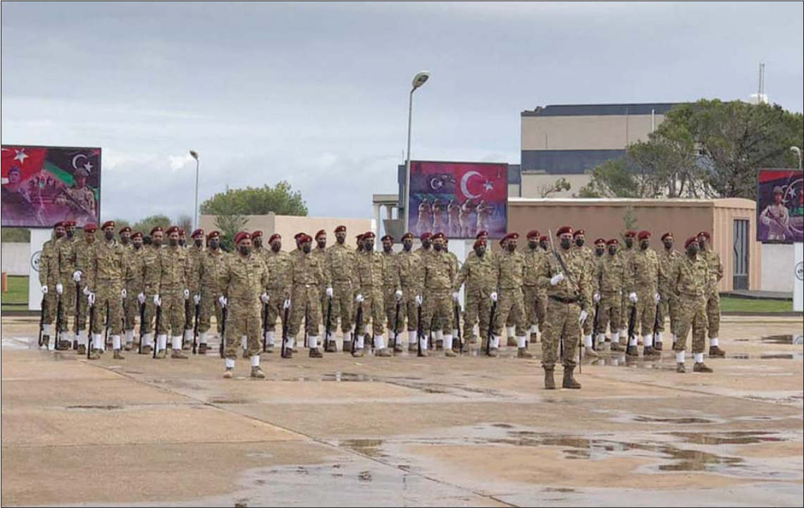
صورة وزعتها قوات «الوفاق» خلال حفل تخريج دفعة من مقاتليها بطرابلس أمس

عائقاً أمام العملية السياسية في ليبيا. وطبقاً للشهود عيان وتقارير إعلامية محلية، فقد شرعت ميليشيات مصراة المسلحة الموالية لحكومة «الوفاق» في إزالة بعض السواتر الترابية بالطريق الداخلية الرابطة بين منطقة القذافية ووادي زمزم، تنفيذاً لقرارات اللجنة العسكرية المشتركة، بفتح الطريق الساحلية. لكن الطرق الرئيسية بين سرت وطرابلس، خصوصاً كولوجية أبو قريين، ما زالت مقطوعة، علماً بأن اللجنة المشتركة (5+5) أعلنت عن تفاهم بإخلاء خطوط التماس بسحب القوات والأليات الثقيلة، وفتح الطريق الساحلية، وإعادة القوات إلى وحداتها بالتنسيق مع لجنة الترتيبات الأمنية.