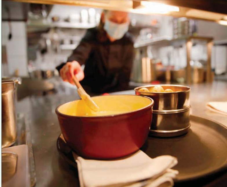
طباخ يرتدي قناعاً وأقياً وهو يحضر طبق الفونديو

جنيف، «الشرق الأوسط» في مكان صغير المساحة حيث يتحدث الموجودون أو يضحكون أو حتى يغنون، وهو ما يشكل الظروف المثالية لتعشي الفونديو.