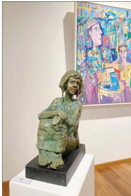
الطنبولي يجمع بين التصوير والنحت في معرض واحد