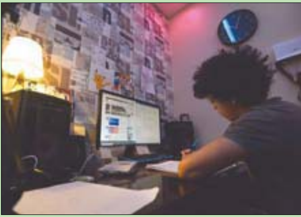
التعليم ليس فقط عن بعد بل معزز بمناهج جديدة (الشرق الأوسط)