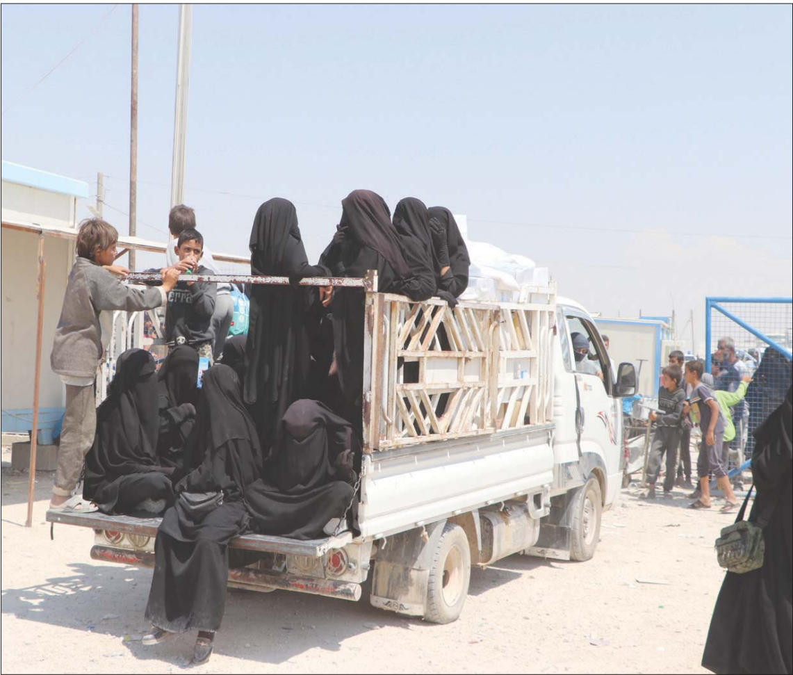
عائلات أشخاص متهمين بالانتماء إلى «داعش» لدى الخروج من مخيم «الهل» شرق سوريا (الشرق الأوسط)

محتجزين بسبب صلاتهم بتنظيم «داعش» بموجب عقوبات. ولا يشمل قرار الإدارة الكردية العراقيين الذين يشكلون غالبية سكان المخيم الذي يضم أيضاً آلاف الأجانب، من نساء وأطفال منطرين، من نحو 50 دولة. ومنذ سقوط مناطق «داعش» في مارس (آذار) 2019، دعت السلطات الكردية المطرئين الذين تحتجزهم وعائلاتهم أو إنشاء محكمة دولية لمحاكمتهم. لكن معظم البلدان، خصوصاً الأوروبية، مترددة في إعادة مواطنيها. وقد أعاد بعض الدول، ومنها فرنسا، عدداً محدوداً من أطفال مطرئين قتلوا في الحرب.