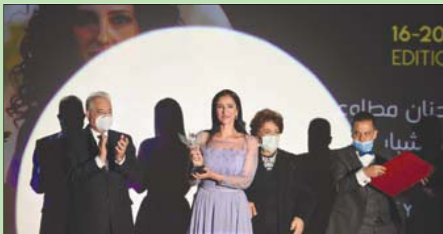
تكريم الفنانة المصرية حنان مطاوع خلال افتتاح المهرجان