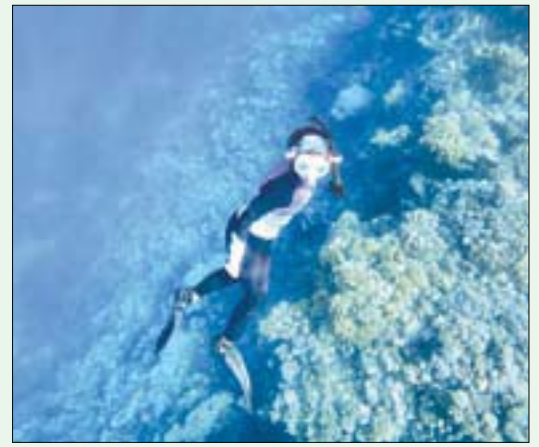
شعاب مرجانية في البحر الأحمر