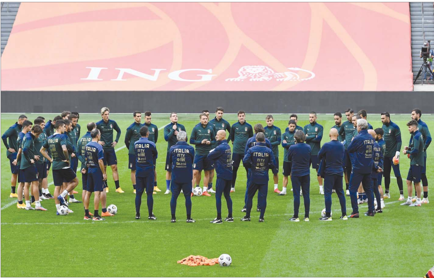
لاعبو إيطاليا يستمعون لتعليمات الجهاز الفني قبل المباراة الحاسمة نحو نصف النهائي (رويترز)

اللاعبين التي لدينا ، والقدرات التي نتمتع بها في الكرة الدنماركية... ورغم تبديد أسأل المنتخب الإنجليزي في التأهل إلى نصف النهائي، ما زال المدير الفني غاريت ساونغيث حريصاً على إنهاء مسيرته في النسخة الحالية من البطولة بشكل جيد وتحقيق فوز يؤكد أن الفريق يسير في الطريق الصحيحة، ويسعى ساونغيث لإنهاء المنافسات بشكل قوي واستغلال مباراة اليوم لاختيار بعض اللاعبين في ظل محاولاته المستمرة لبناء تشكيلة يمكنها المنافسة على كأس الأمم الأوروبية (يورو 2020) التي تأجلت لمنصف عام 2021 وكذلك مونديال 2022.