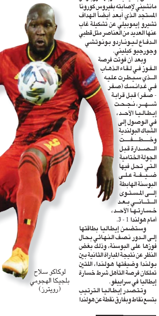
لوكاكو سلاح بلجيكا الهجومى

ولدهم في الأوقات الصعبة ويصبحون أكثر تماسكاً، وأضاف: «شددت قبل المباراة على ضرورة إظهار الروح والتماسك، كان الجميع راضين، بقينا أوفياء الأسلوب على المدى الطويل، فستكافأ على جهودك».