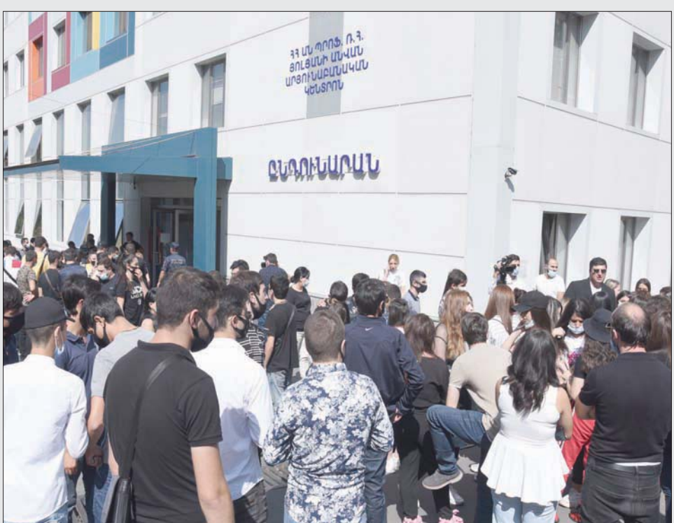
مع موسكو، وقال إن أرمينيا لن تغادر «منظمة معاهدة الأمن الجماعي» و«الاتحاد الاقتصادي الأوراسي». وأوضح أنه «ليس لدينا مشاكل مع الاتحاد الاقتصادي الأوراسي» و«الاتحاد الاقتصادي الأوراسي» في وبعد وصوله إلى السلطة، انضحت معالم التبدل في نظرتة إلى العلاقة

يشكل عنصراً جاعلاً لكل أرمينيا، ما يعني أن باشينيان الذي كان رفع شعار «الدفاع عن أرتساخ» (أرتساخ الاسم الأرميني للإقليم) خلال قيادته الأعمال الاحتجاجية في يريفان في 2018 لا يمكنه التراجع وقبول تسوية جديدة تنهي السيطرة الأرمينية على جزء من الإقليم المتنازع عليه.