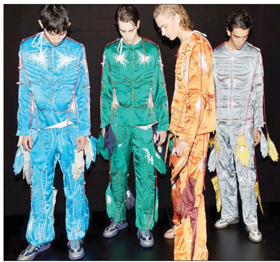
اتسم أسبوع لندن بالجرأة في التصاميم والألوان وخاطب شريحة معينة من الشباب

تغير الأحوال وأن الأمال الكبيرة التي كانت معقودة على الرجل بدأت تضعف في ظل «المناخ الحالي الناجم عن الجائحة، واستناداً إلى التحديتات المتعلقة بحركة المضاعف والعينات والأشخاص في السوق الموحدة والاتحاد الجمركي بعد خروج بريطانيا من الاتحاد الأوروبي، بحسب البيان البريطاني، الذي أشار أيضاً إلى أنه كان نتيجة استطلاعات ونقاشات عدة مع صناع الموضة ومع مصممين. فقد كان مهماً، بحسب البيان «تطبيق الأزمة» الخافقة التي يعاني منها قطاع الموضة والتي كانت وراء إنشاء مجلس الأزياء البريطاني صندوق طوارئ إسترليني 1.09 مليون جنيه (سبعة ملايين يورو) لمساعدة المصممين والعاملين في هذا المجال. وهم أكثر إذا أخذنا بعين الاعتبار أن صناعة الموضة البريطانية توظف أكثر من 890 ألف شخص وتساهم بمبلغ 35 مليار جنيه إسترليني (39 مليار يورو) في الناتج المحلي الإجمالي للمملكة المتحدة حسب دراسة تعود إلى عام 2019.