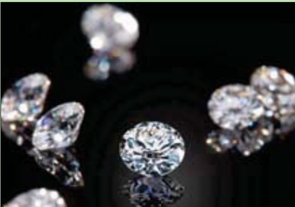
الماس أفضل صديق للبيئة

تقنية القرن الحادي والعشرين. وهو من ذلك النوع الدقيق من الأشياء التي تحتاج إلى القيام بها لمكافحة المناخ وأزمات الاستدامة الأخرى، ويمكننا أيضاً الاستمرار في العيش بالطريقة التي اعتدناها والتي نريد أن نعيش بها، بحسب فينس، مضيفاً أن الماس الجديد صديق البيئة سيكون متاحاً بالطلب المسبق مع بداية لعام المقبل.