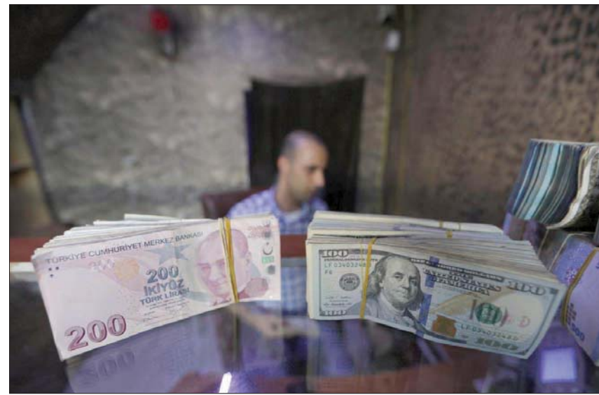
تشير أغلب التوقعات إلى أن «المركزي» التركي سيتجه مجبراً لرفع كبير لأسعار الفائدة رغم معارضة الرئيس إردوغان... في محاولة أخيرة لوقف انهيار الليرة

وقدقت الليرة التركية 26 في المائة هذا العام، وأكثر من نصف قيمتها منذ نهاية 2017. لتصبح العملة الأسوأ أداءً في الأسواق الناشئة. ويسير الاقتصاد التركي في