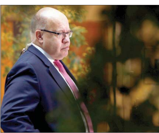
وزير الاقتصاد الألماني بيتر التماير في مؤتمر صحفي ببرلين أمس للإعلان عن توقعات النمو

برلين، «الشرق الأوسط»، تبدو التوقعات شديدة المتضارب بالنسبة لتعافي الاقتصاد الألماني عقب الانهيار المرتبط بجائحة كورونا في الربع الماضي. ففي حين تشير الأرقام الرسمية إلى تحسن وتفاؤل، فإن تقديرات أخرى تتوقع أن يستغرق الأمر نحو 3 سنوات للعودة إلى مستويات ما قبل الجائحة. وأعلن مكتب الإحصاء الاقتصادي الألماني، الجمعة، استناداً إلى بيانات مؤقتة، أن ارتفاع المحلي الإجمالي لألمانيا ارتفع في الربع الثالث من هذا العام بنسبة 8,2 في المائة، في مقابل الربع الثاني. وبحسب البيانات، فإن الناتج المحلي الإجمالي لأكثر اقتصاد في أوروبا تراجع في الربع الثالث من هذا العام،