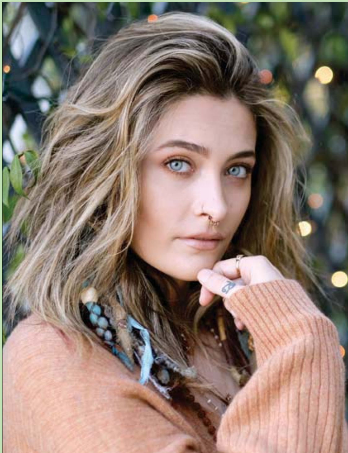
الغنية الأميركية باريس جاكسون تقف لالتقاط صورة لها في بيغفري هيلز للترويج لاليومها «ذابل» الذي يصدر في 13 نوفمبر

أما البلد الآخر، بلدنا، فأخبره لا تتغير. وعنوانها واحد هو عنوان مسرحية شوشو «أخ يا بلدنا».