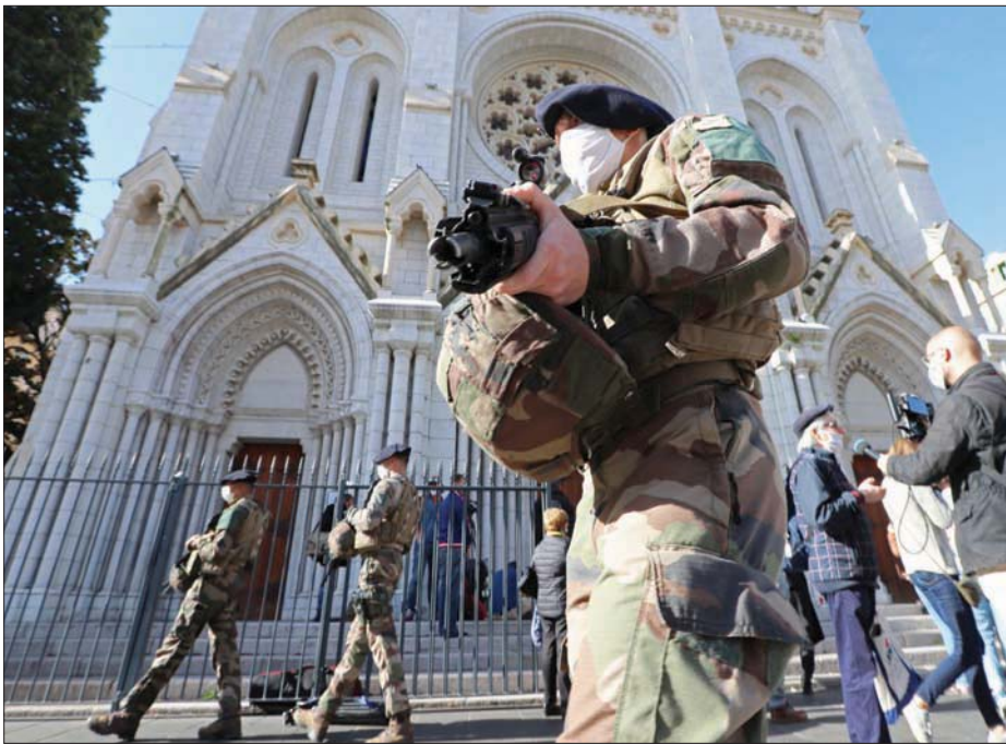
استنفار أمني أمس أمام كاتدرائية نوتردام في مدينة نيس الفرنسية بعد الهجوم الإرهابي

التحقيق القضائي الذي أمر به المدعي العام المتخصص بالشؤون الإرهابية لم يتقدم كثيراً. ويعول المحققون على الهاتفين الجوالين اللذين عثرا عليهما في حقيبة ظهر تعود للجاني من أجل التعرف على مساره. ولا يعلم المحققون تاريخ وصول منفذ العملية إلى الأراضي الفرنسية والطريق التي سلكها لهذه الغاية. وأخر أثر له في إيطاليا يعود للتاسع من أكتوبر (تشرين الأول) عندما قبض عليه في مدينة باري ونقل إلى مقر الشرطة، حيث أخذت له صورة نصفية وهو يحمل الرقم 104. أما أول أثر له في فرنسا فكانه محطة القطارات في مدينة نيس التي دخلها قبل الساعة السابعة صباحاً، بحسب ما ظهره تسجيلات كاميرات المراقبة التي تبين أنه بدل حذاءه وقلبه سترته. وتبعت الكاتدرائية التي دخلها في الثامنة والنصف من محطة القطارات مسافة 400 متر. وليس منطوقاً اعتبار أنه قضى 90 دقيقة لاجتياز هذه المسافة القصيرة. ولذا، تسعى الأجهزة الأمنية لمعرفة ما الذي فعله في نيس طيلة هذه الفترة. واستطاعت قناة تلفزيونية فرنسية الاتصال بشقيق الجاني الذي كشف أن أخيه اتصل بعائلته في تونس ليل الأربعاء ليخبرها أنه انتقل إلى