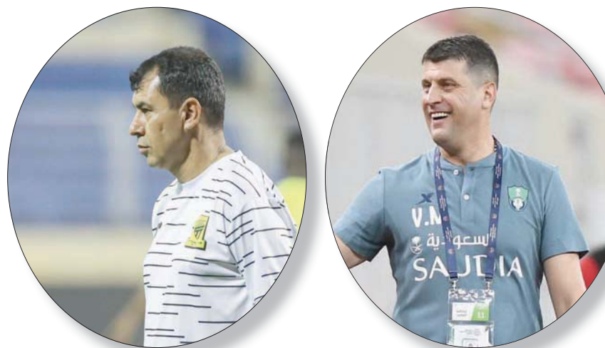
فلادان (الشرق الأوسط)