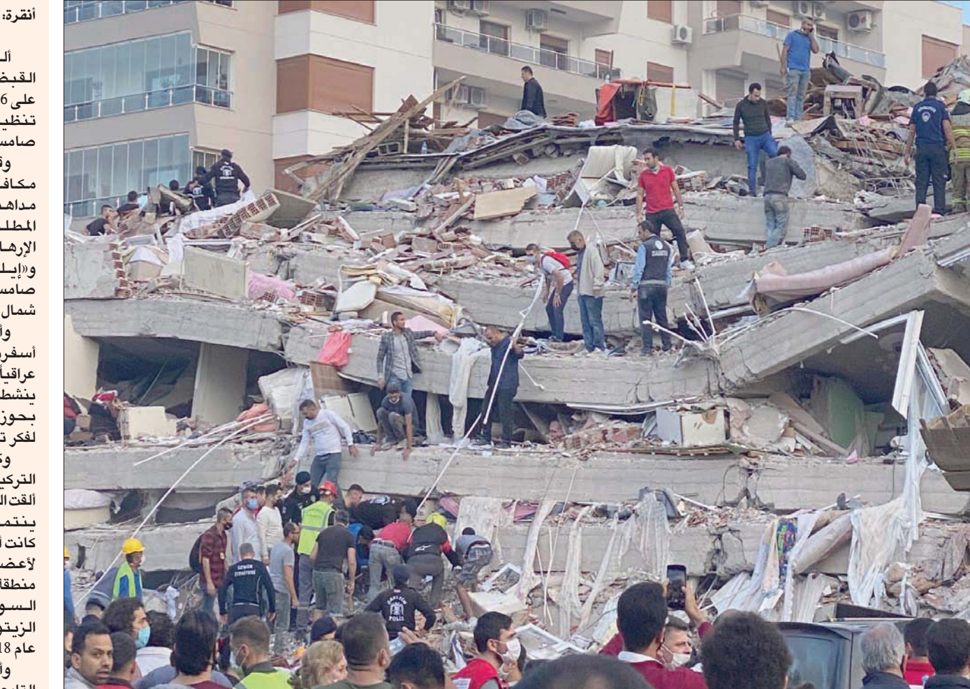
فرق الإنقاذ ما زالت تحاول إخراج الناس من تحت الأنقاض

والقت قوات مكافحة الإرهاب التابعة لمديرية أمن إسطنبول في حملة موسعة نفذتها الأسبوع الماضي على خلايا تنظيم «داعش» القبض على 14 من عناصر التنظيم 13 أجنبياً وتركياً واحد. وذكر بيان مديرية الأمن العام في إسطنبول، أن العملية الأمنية استهدفت ضبط مشتبهين بتنفيذ أنشطة باسم تنظيم «داعش» الإرهابي، وفي هذا الإطار، داهمت فرق مكافحة الإرهاب المدعومة