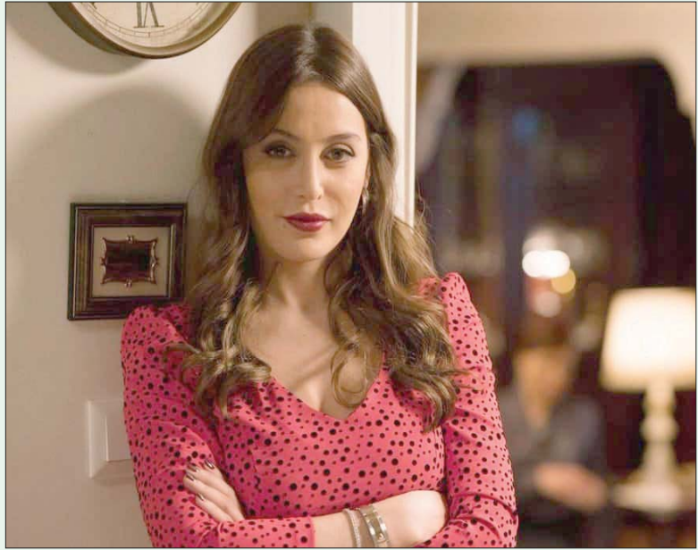
لقطة من دورها في «عروس بيروت»

إنسان لديها ما يشغلها من أمور على مدار يومه. ● وهل تأثرت وجهة نظر العمل في الجزء الثاني، بتغيير المخرج التركي إيمري كاياكوشك؟ - لا على الإطلاق، فهناك سيناريو عام يحكم المسألة كلها، ولكن في النهاية كل مخرج له وجهة نظره في العرض، فإيمري كاياكوشك مدرسة مختلفة كثيراً عن فكرت قاضي الذي تولى الموسم الثاني، ولكن لم نشعر نحن الممثلين بأن التغيير طرأ على الخط العام للمسلسل، أو تسبب لنا في مشكلات؛ لأن السيناريو جيد جداً ومكتوب باحترافية، كما أن كلاً منا يعرف ملامح شخصيته جيداً منذ الجزء الأول.