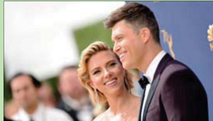
سكارليت مع زوجها الممثل كولين جوست