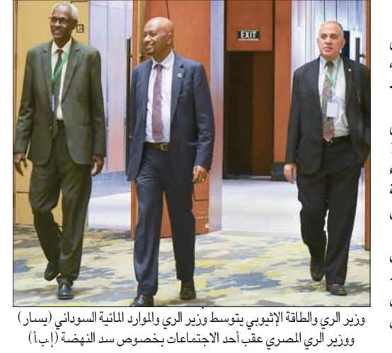
وزير الري والطاقة الإثيوبي يتوسط وزير الري والموارد المائية السوداني (يسار) ووزير الري المصري عقب أحد الاجتماعات بخصوص سد النهضة (أبأ).

القاهرة، «التشرق الأوسط»، منذ نحو 10 سنوات، ومنذ إعلان إثيوبيا عزمها بناء «سد النهضة» على «النيل الأزرق»، سعت الولايات المتحدة، إلى دفع البلدين لحل ودي للنزاع، من خلال عبارات دبلوماسية تشير إلى ضرورة تعاون كل الأطراف، ومن دون تدخل مؤثر. إلا أن الموقف اختلف كثيراً خلال العامين الأخيرين، عندما قررت إدارة الرئيس دونالد ترمب، الدفع بتقلها لحل القضية، باعتبارها أكبر جهة داعمة للدولتين من حيث المساعدات العسكرية والاقتصادية. وجاء الدور المباشر لواشنطن، على النحو التالي: - سبتمبر (أيلول) 2019: وزارة الري المصرية تعلن تعثر المفاوضات الثلاثية، وفشل الوصول إلى اتفاق. والرئيس المصري يدعو خلال إلقائه خطاباً أمام الجمعية العامة للأمم المتحدة إلى تدخل دولي لحلحلة الأزمة. - البيت الأبيض يعلن دعم الولايات المتحدة للمفاوضات