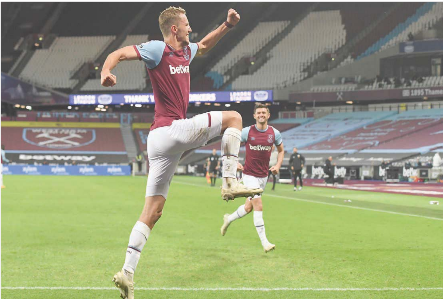
النجم العملاق التشيكي توماس سوتشيك أضاف قوة إلى خط وسط وستهام

أن كنت صغيرا وأنا أقول لنفسي إنه يتعين علي أن أكون قادرا على تغطية كل شبر من أنحاء الملعب. كنت أرغب في مساعدة زملائي في كل موقف داخل الملعب، وقد ساعدني قدمي الطويلتان على ذلك. طول قامتي يناسب طريقة لعبي تماما، وقد ساعدني على اللعب بهذا الشكل حتى الآن». وشكل سوتشيك شراكة قوية للغاية في خط وسط وستهام مع ديكلان رايس، الذي يبذل مجهودا كبيرا ويسمح له بالتقدم كثيرا للاضام من أجل القيام بواجباته الهجومية واقتحام منطقة جزاء الفرق المنافسة. وإرسال كرات عرضية خطيرة. وقد سجل سوتشيك ثلاثة أهداف في نهاية الموسم الماضي، وساعد وستهام على البقاء في الدوري الإنجليزي الممتاز، قبل أن يقرر النادي التعاقد معه بصفقة دائمة. ومع ذلك، فإن سوتشيك، الذي كان يشجع أرسنال بسبب وجود مواطنه الدولي السابق توماس روزيسكي في ملعب الإمارات، لا يتميز بالوقفة البدنية الهائلة فحسب، لكنه يجيد الاستحواذ على الكرة أيضا، ويؤكد على أن مصدر إلهامه في هذا الأمر هو النجم الإفريقي يابا توريه.