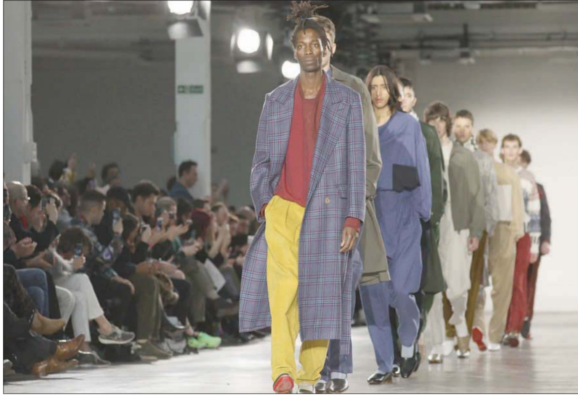
كان الكل متحمساً لأسبوع رجالي... لكن الرياح تجري بما لا تشتهي السفن

تغير الأحوال وأن الأمال الكبيرة التي كانت معقودة على الرجل بدأت تضعف في ظل «المناخ الحالي الناجم عن الجائحة، واستناداً إلى التحديتات المتعلقة بحركة المضاعف والعينات والأشخاص في السوق الموحدة والاتحاد الجمركي بعد خروج بريطانيا من الاتحاد الأوروبي، بحسب البيان البريطاني، الذي أشار أيضاً إلى أنه كان نتيجة استطلاعات ونقاشات عدة مع صناع الموضة ومع مصممين. فقد كان مهماً، بحسب البيان «تطبيق الأزمة» الخافقة التي يعاني منها قطاع الموضة والتي كانت وراء إنشاء مجلس الأزياء البريطاني صندوق طوارئ إسترليني 1.09 مليون جنيه (سبعة ملايين يورو) لمساعدة المصممين والعاملين في هذا المجال. وهم أكثر إذا أخذنا بعين الاعتبار أن صناعة الموضة البريطانية توظف أكثر من 890 ألف شخص وتساهم بمبلغ 35 مليار جنيه إسترليني (39 مليار يورو) في الناتج المحلي الإجمالي للمملكة المتحدة حسب دراسة تعود إلى عام 2019.