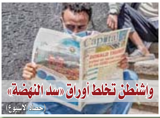
واشنطن تخطط أوراق «سد النهضة» (حصاة الأسبوع)