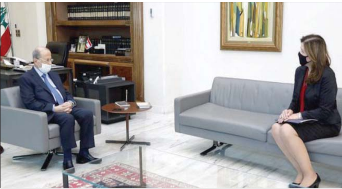
الرئيس ميشال عون مجتمعاً أمس مع السفيرة الأميركية دوروثي شيا

تبقى الأولوية في هذه المرحلة لعملية الإنقاذ المالي التي يجب أن تنجح بها الحكومة العتيدة عبر تنفيذ الإصلاحات المطلوبة وإعادة الثقة الدولية والمحلية». وشهدت السنوات الـ4 الأولى من عهد عون أزمتا كبرى، انفجر جزء منها في وجهه، وانزها الأزمة الاقتصادية والمالية التي بلغت مداها هذا العام مع انهيار الليرة اللبنانية وبلوغها مستويات غير مسبوقة، إضافة إلى انفجار مرفأ بيروت الذي أدى لدمار قسم كبير من العاصمة، مروراً بالخسائر الكبرى التي تكبدتها كل القطاعات نتيجة فيروس «كورونا» الذي لا يزال يتفشى بقوة في كل المناطق اللبنانية. أما التحدي الأبرز الذي واجهه هو، فكان اندلاع الانتفاضة في 17 أكتوبر (تشرين الأول) 2019 التي رفعت شعار «كلين يعني كلن» مطالبة بإسقاط كل الطبقة الحاكمة.