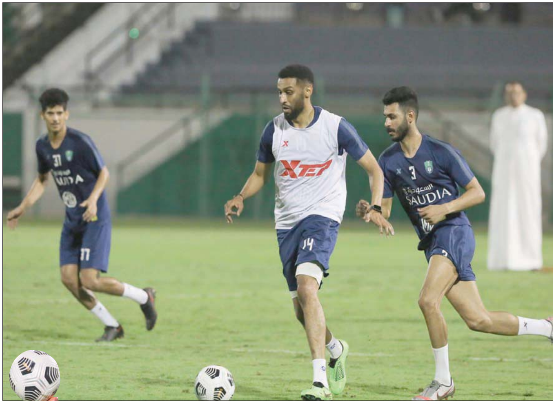
من استعدادات الأهلي للديربي

وفي ثالث مباريات هذا اليوم، يحل الاتفاق ضيفاً على نظيره فريق أباها في مباراة يتطلع من خلالها لمواصلة تحقيق انتصاراته بحثاً عن الاستمرار بالحضور في صدارة لائحة الترتيب، حيث يحل فارس الدهناء في الصدارة بست نقاط جاءت بعد فوزه على