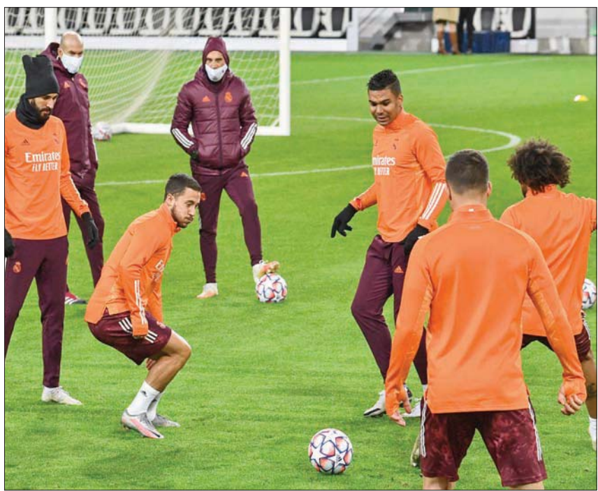
لاعب ريال مدريد في التدريبات لاستئناف المشوار المحلي بعد تعادل مخيب أوروبياً

عازماً على منح هازارد الوقت الكافي للتعافي تماماً. ويعتقد أن على النادي الحذر تجاه هذا الأمر. وقال مدرب ريال مدريد: «لقد بدأ اللعب للوقت. هذه مباراته الأولى بعد فترة طويلة، كانت الخطة بالنسبة له أن يحاول اللعب، ولكن يتعين عليه القيام بذلك شيئاً فشيئاً». فوز ريال على هويسكا قد يعيده إلى صدارة الترتيب، متقدماً على ريال سوسيداد متتالية. وسيلعب سوسيداد خارج أرضه ضد سيلتا فيغو غداً، قبل أن يستضيف غرناطة صاحب المركز الثالث ليفانتي، فيما يلعب فالنسيا المتعثر على أرضه أمام خيتافي. وفي حال فاز أتلتيكو مدريد، الوحيد الذي لم يخسر بعد، بمباراته المؤجلة فساحل الصدارة، إذ يلعب فريق المدرب الأرجنتيني دييغو سيميوني خارج أرضه في أواسونو اليوم.