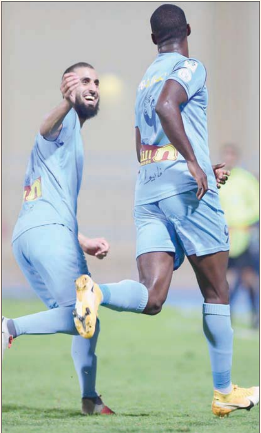
فرحة لاعبي الباطن بعد هدف الفوز على الرائد