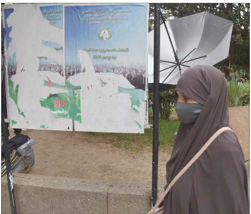
إعلانات ممزقة تروج للاستفتاء الدستوري في حي باب الوادي بالعاصمة الجزائرية (أ.ب)

وانضم أمس، وزير الخارجية الألماني، هايكو ماس، إلى قائمة مطالبه السراج بعدم التخلي عن منصبه، حيث طالبه في اتصال هاتفي باسم مستشارته الألمانية بالبقاء في موقعه و«إداء مهامه