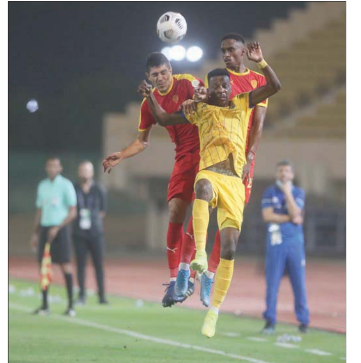
من مباراة القادسية الأخيرة أمام التعاون

وحقق القادسية فوزاً مهماً وصعباً على التعاون هو الثاني على أرضه بملعب مدينة الأمير سعود بن جلوي الرياضية بالراكة، ليتقدم خطوات مهمة للأمام في جدول الترتيب، ويؤكد عزمه على الحصاد المبكر للنقاط للابتعاد عن تهديد الهبوط مجدداً لدوري الدرجة