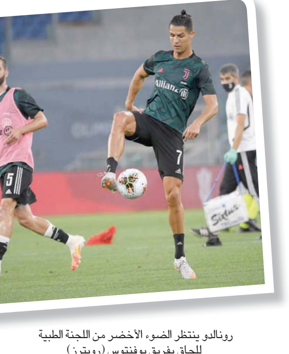
رونالدو ينتظر الضوء الأخضر من اللجنة الطبية للحاق بفريق يوفنتوس (رويترز)

بقية الأبطال الذين ينتظرون الضوء الأخضر من اللجنة الطبية للحاق بفريق يوفنتوس (رويترز)