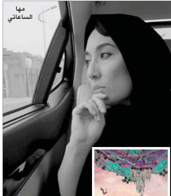
ملصق مشروع فيلم «هج إلى ديزني»

قالت المخرجة السعودية مها الساعاتي، إن فوزها بجائزة «منصة الجونة» السينمائي (جنوب شرقي القاهرة) سياسمهم في تطوير سيناريو فيلمها الروائي الأول «هج إلى ديزني»، مؤكدة أن «الداعم الرئيسي للفيلم هو «معمل البحر الأحمر للآفلام» بالسعودية، ولم تتمكن الساعاتي من حضور فعاليات مهرجان الجونة، وتواصلت مع «الشرق الأوسط» معها هاتفياً، وقالت إنها ستعمل على تطوير السيناريو أيضاً خلال حضورها ورشة عمل تتزامن مع توزيع جوائز «غولدن غلوب» في شهر فبراير (شباط) عام 2021.