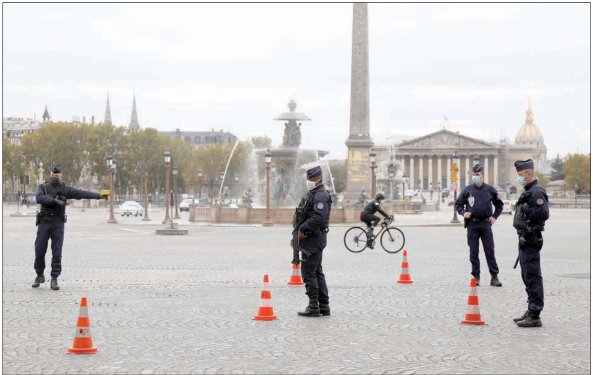
الشرطة تراقب الأماكن العامة في باريس أمس لتطبيق التدابير الجديدة

ويعد أن تضاعف عدد الحالات الخطرة في أوروبا خلال الأسابيع الثلاثة المنصرمة، حسب البيانات الأخيرة للمركز الأوروبي لمكافحة الوباء، قالت المفوضية الأوروبية لشؤون الصحة ستيفلا كيرياكيس، إن الوضع أصبح بالغ الخطورة، ويستدعي إجراءات سريعة وجزرية لاحتواء الوباء، وتخير الوضع الوبائي في الجمهورية التشيكية قلقاً كبيراً في الأوساط الصحية الأوروبية. بعد أن وصل معدل انتشار الإصابات إلى 1449 لكل مائة ألف مواطن، ما دفع الحكومة إلى تكليف القوات المسلحة بإقامة مستشفى ميداني ضخم في العاصمة براغ يتسع لأكثر من 500 سرير لمعالجة الحالات المعتدلة، وإتاحة المجال أمام المستشفيات الأخرى لعلاج الإصابات الخطرة. يذكر أن عدد الذين كانوا يعالجون من «كوفيد - 19» في الجمهورية التشيكية مطلع أغسطس (آب) الفائت لم يكن يتجاوز