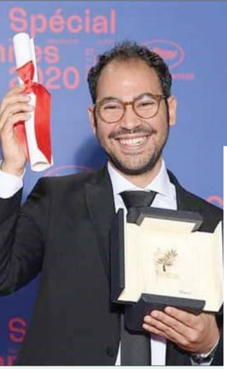
المخرج سامح علاء وجائزة «السعفة الذهبية»... وفي الأطار بوستر فيلم «ستاشر» (صفحة المنتج محمد تيمور على «فيسبوك»)