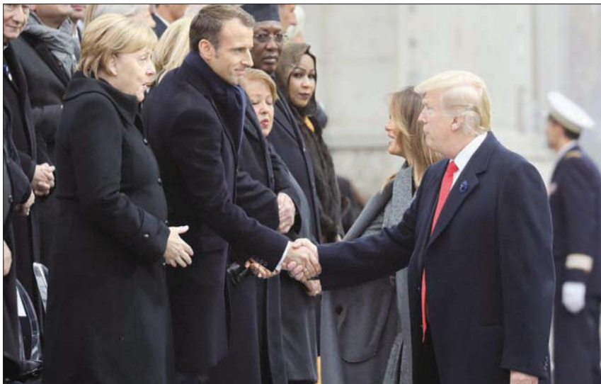
ترمب وزوجته أثناء مشاركتهما في ذكرى نهاية الحرب العالمية الأولى بباريس في نوفمبر 2018

مع الولايات المتحدة، وهو ما قد يشكل مادة خلافية مستمرة بين الطرفين. كما أنه ليس سرا أن الاستراتيجية الأميركية الدفاعية والخارجية التي يعتمدها ترمب، هي استمرار للاستراتيجية التي دعا إليها سلفه أوباما عندما قال إن التركيز من الآن فصاعداً سيكون على المحيط الهادئ، وليس بايدن ليس غريباً عن هذه السياسة وقد يضاعف من خض اهتمام أميركا «بالقارة العجوز»، بعدما تحولت الحرب الباردة إلى صراع مع الصين وليس مع روسيا. ومع تصاعد الجول الانعزالية داخل الولايات المتحدة، قد يجد بايدن نفسه قبل ترمب محكوماً باتجاهات الاستقطاب السياسي الداخلي، والدعوة إلى خفض التدخل بالخارج، وهي سياسة بدأها أوباما أيضاً، وانعكاس ذلك على القيادة العالمية لاي رئيس أميركي