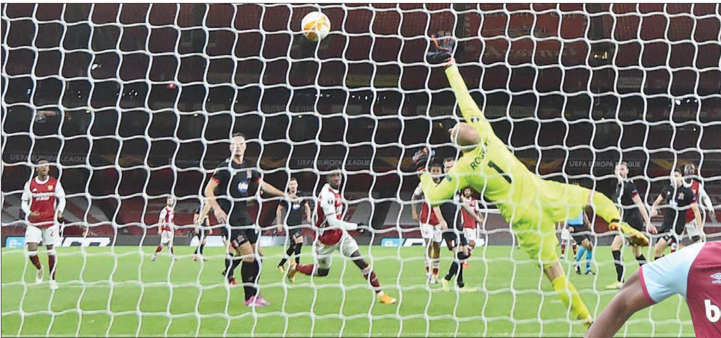
نيكولاس بيبي لاعب آرسنال يسجل في مرمرى دونالد الأيرلندي في اختبار جيد قبل مواجهة يونايتد

وتختتم المرحلة الاثني عشر بمباراة قوية بين ليدز يونايتد والسادس وليستر الرابع، ويعول ليستر على هدافه المخضرم