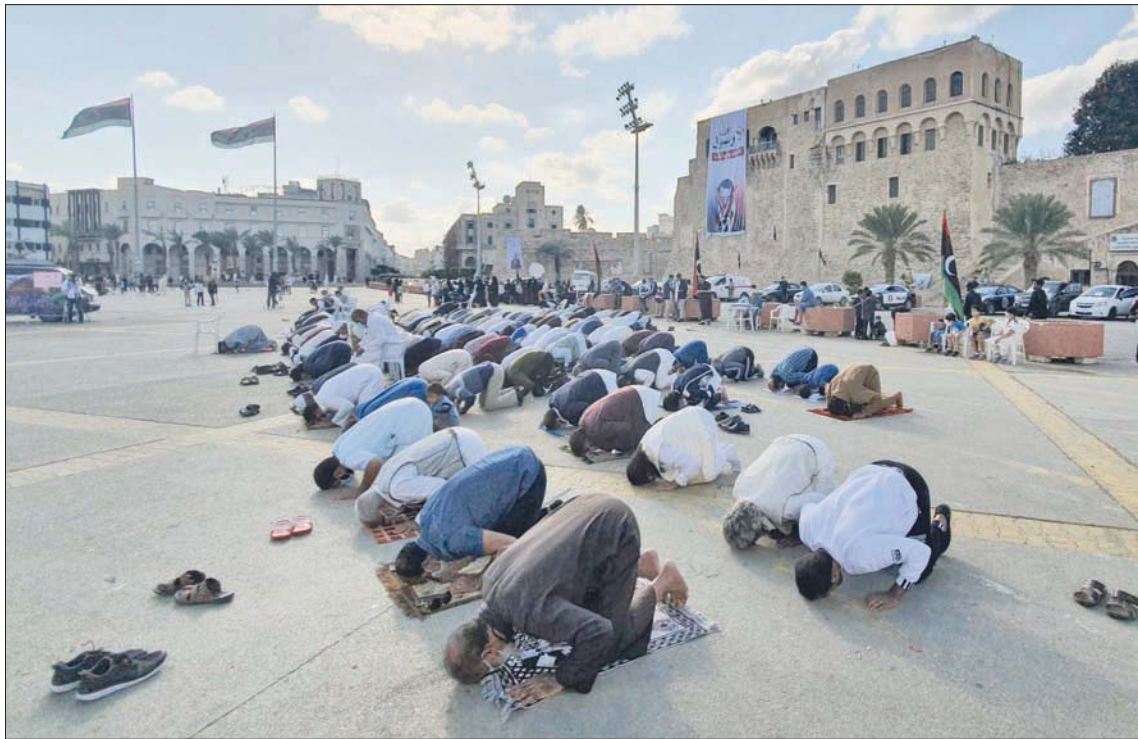
ليبيون يؤدون صلاة الجمعة في ساحة الشهداء بطرابلس التي شهدت احتجاجاً أمس ضد الرسوم المسيئة للرسول الكريم

في مختلف المجالات والارتقاء بها إلى المستوى الذي نتطلع إليه على درب الشراكة والتكامل».