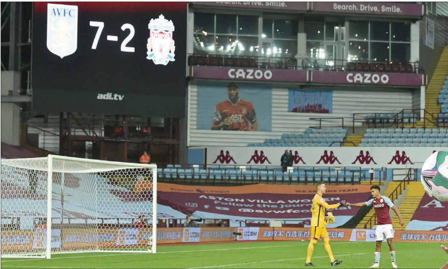
مباراة أستون فيلا وليفربول شهدت 9 أهداف في أعلى نسبة هذا الموسم

يجب الالتزام بها - غير مالوفة وسجكون لها تأثير نفسي كبير على اللاعبين، وهو الأمر الذي قد يؤدي إلى انخفاض المستوى وارتكاب الأخطاء. وأود أيضا أن أعرف ما إذا كان مستوى المباريات قد تأثر بسماع أصوات المديرين الفنيين وهم يوجهون التعليمات للاعبين، وأصوات اللاعبين أنفسهم وهم يتحدثون مع بعضهم البعض؟ يقول لينكر عن ذلك: «دائما ما يصرخ المدربون الفنيون من الخارج، لكن في ظل الصخب لا يسمعون صوت المديرين الفنيين، أو يظهرون بأنهم لا يسمعون. خلال الموسم الماضي كنا نغطي المباراة النهائية لكأس الاتحاد الإنجليزي على ملعب ويمبلي، ولم يكن هناك سوى عدد قليل من الإعلاميين، وكان إيمان رايت يعلق على المباراة من الملعب. وبعد انتهاء المباراة، ركض لاعبو أرسنال الذين كانوا يحتفلون بالفوز بتجاه رايت وقالوا له إنهم كانوا يسعون كل ما كان يقوله أثناء التعليق.»