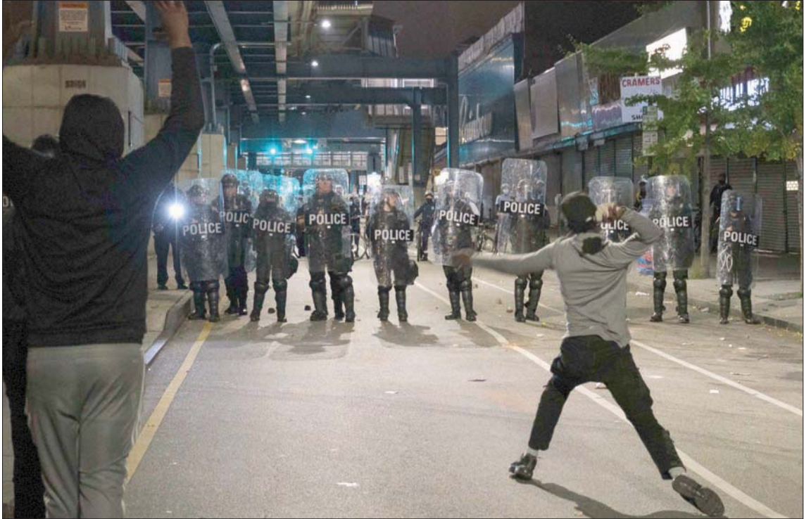
شهدت فيلادلفيا مساء الثلاثاء، مواجهات بين متظاهرين وقوات الأمن بعد مقتل رجل أسود على يد الشرطة

واشنطن، إيلي يوسف فيما تجمع الآراء والتوقعات على وصف يوم الثالث من نوفمبر تشرين الثاني بأنه سيكون يوماً انتخابياً لم يسبق له مثيل في الحياة السياسية الأميركية، تتجه الأنظار نحو الاستعدادات الأمنية، التي تتخذها السلطات الفيدرالية والمحلية، لحماية العملية الانتخابية وما بعدها، في ظل حالة التوتر الممتدة منذ أحداث العنف التي اندلعت في مايو أيار الماضي، بعد مقتل الرجل الأسود جورج فلويد على يد شرطي أبيض في ولاية مينيسوتا.