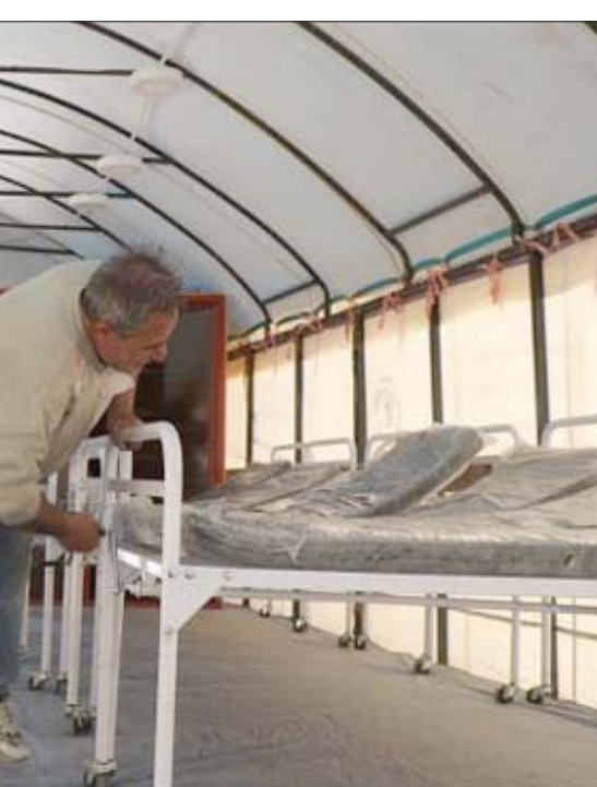
مركز العزل التابع للجنة الدولية للصليب الأحمر في مخيم الهول (الشرق الأوسط)

في مخيم الهول (جنوب الحسكة)، تخشى الطواقم الطبية والمنظمات الإنسانية من استفحال جائحة «كوفيد-19» في أكبر مخيم مكتظ من نوعه في سوريا، بعد تسجيلها إصابتين أمس، حيث يعاني من نقص في الإمدادات الطبية والوقود اللازم لتفدئة المخيم مع قدوم الشتاء. وسجلت «الإدارة الذاتية» (شرق الفرات)، قبل يومين، إصابة حالتين في مخيم الهول الذي يعاني من ظروف إنسانية وصحية كارثية. وكانت قد ظهرت أول حالة نهاية أغسطس (آب) من اللجنة الدولية للصليب الأحمر في مخيم الهول، حيث كان في وضع كارثي بعد ظهور إمكانية تفشي الوباء بين قاطنيه، وكانت قد سجلت بالشهر نفسه إصابة 3 عاملين من الطواقم الطبية بفيروس كورونا المستجد يعملون لدى منظمة «الهلال الأحمر» الكردية المحلية. والمخيم الواقع على بعد نحو 45 كيلومتراً شرق محافظة الحسكة يضم 65 ألفاً، معظمهم من السوريين والعراقيين. كما يؤوي الآلاف من عائلات مقاتلي تنظيم داعش الإرهابي في شمال شرقي سوريا، ويعاني نقصاً في الحاجيات الصحية. وتعاني مناطق شرق الفرات أساساً من نقص بالمعدات