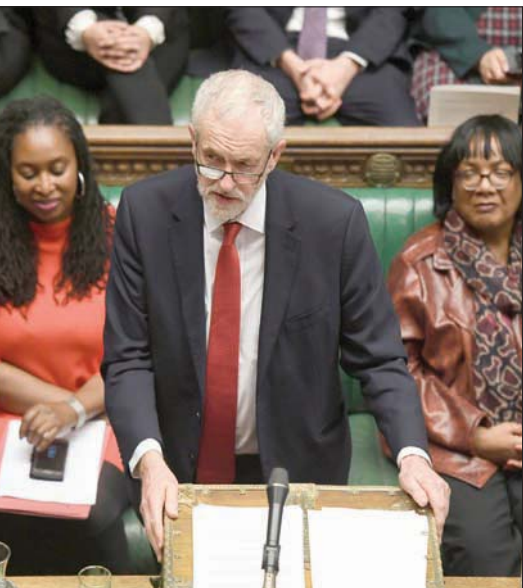
جيريمي كوربين خلال فترة قيادته للحزب بين عامي 2015 و2019

على تمييز نفسه عن سلفه جيريمي كوربين. وفي يونيو (حزيران) أعلن ستارم أنه طلب استقالة مسؤولة في قيادة الحزب لأنها أعادت نشر تغريدة على «تويتر» اعتبرت أنها تندرج في إطار معاداة السامية. ورفض ستارم توضيح إذا كان سيطرد الآن كوربين مضيئاً عن بعض الشكاوى لم يتم التحقيق فيها على الإطلاق من دون مير. كما كشف التقرير عن «أدلة على التدخل السياسي في التعامل مع شكاوى معاداة السامية طوال فترة التحقيق». وحسب التقرير، فإن الأدلة ترقى إلى مستوى الانتهاكات لقانون المساواة. واعتذر الزعيم الجديد ستارم عن هذه الإخفاقات خلال عهد سلفه. وقال كير الذي يقود الحزب منذ أبريل (نيسان) الفائت، إنه يقبل كامل نتائج التحقيق السياسي، وسيقدم التوصيات على الفور. وأضاف: «إنه يوم مخز لحزب العمال. خذنا اليهود وأعضاء ومؤيدينا والشعب البريطاني». ومنذ وصوله إلى رئاسة حزب العمال، انضم اهتمام ستارم على إدارة مسألة معاداة السامية داخل الحزب، مع حرص