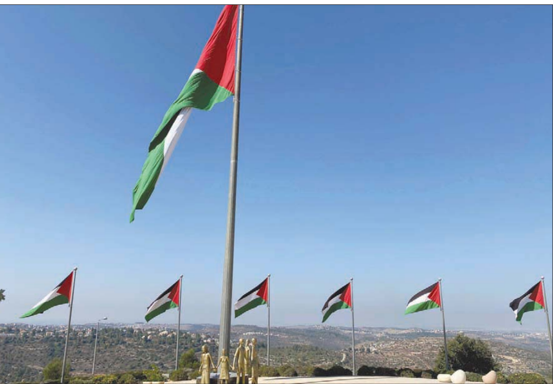
أعلام فلسطينية في مدينة الروابي الجديدة في الضفة الغربية

وأشاروا إلى أن الفلسطينيين لم يكونوا بهذا الضعف من قبل. يمكن أن يخسروا كل شيء». وفكرة الدولة الواحدة المتساوية، لم تطرح للمرة الأولى من خلال الانفكاك عن الاحتلال عبر استراتيجية المصمود المقاوم حتى الاستقلال التام، إلى ذلك نستمر في تجسيد دولتنا على الأرض».