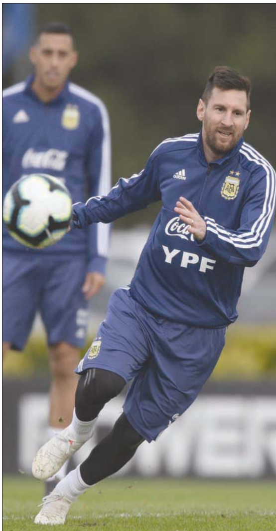
ميسي يعود لقيادة منتخب الأرجنتين بحثاً عن الإنجاز الغائب عن سجله

وحذر الاتحاد الدولي للاعبين المحترفين (فيفبرو) من مخاطر السفر التي يواجهها نحو 250 لاعباً من بينهم نجوم عالميون مثل الأرجنتيني ليونيل ميسي (برشلونة الإسباني) والبرازيلي نيمار دا سيلفا (باريس سان جيرمان الفرنسي) والكولومبي خاميس رودريغيز (إيفرتون الإنجليزي) والأوروغواياني لويس سواريز (انتيفكو مدريد الإسباني)، لكن الجميع التزموا ببدء منتخبات