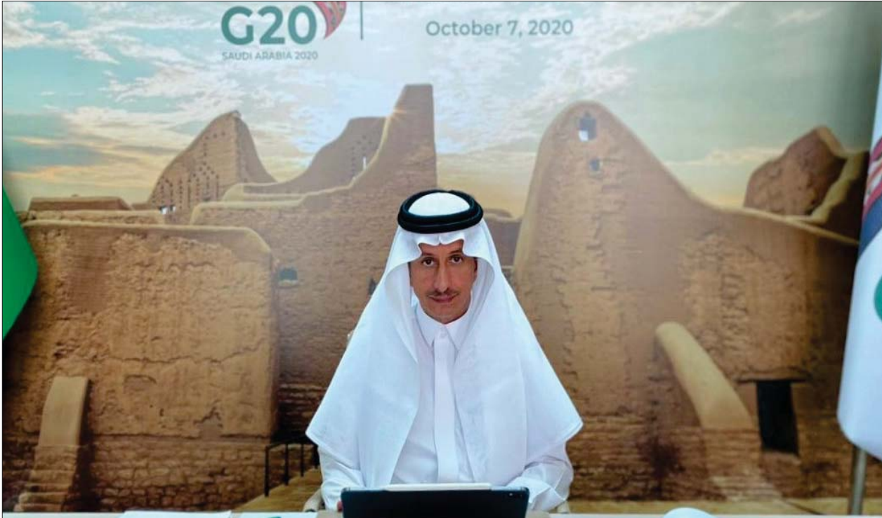
وزير السياحة السعودي خلال رئاسة الاجتماع الوزاري لقطاع السياحة تحت مظلة مجموعة العشرين أمس

الرئيسيين الداعمين للتنمية المحلية؛ والتقدم نحو السياسات القائمة على الأدلة والقائمة على قياس السياحة المستدامة بما يتماشى مع المعايير الدولية؛ وأخيراً استعراض الممارسات والتجارب الجيدة.