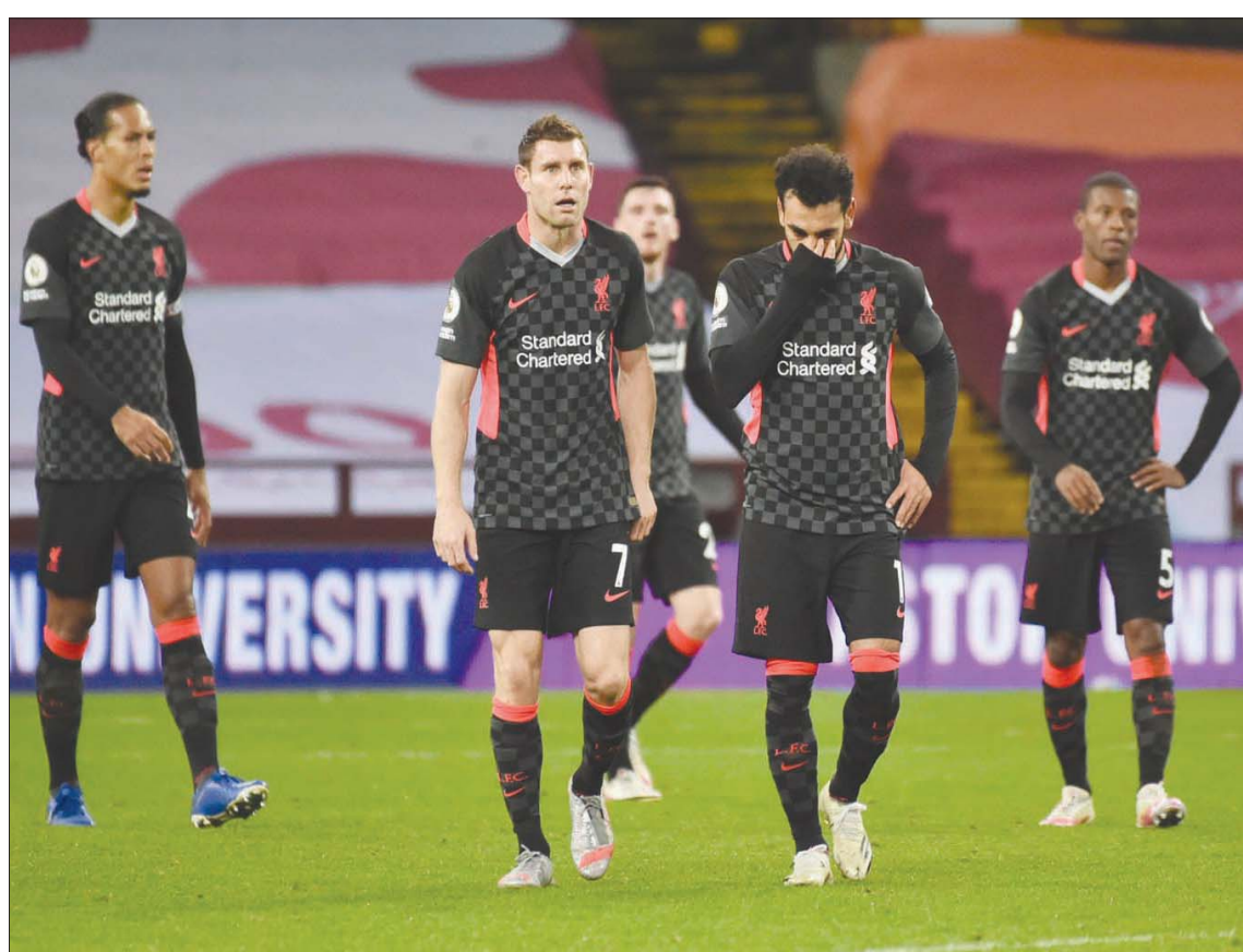
هل يلعب ليفربول بطريقة تنطوي على المخاطرة؟

وعلى مدى العقد التالى، غير مانشستر يونايتد الطريقة التى يلعب بها، لكن يوجد مقياس متدرج لإدارة المباريات. لكن من الواضح أن كلوب يسمح لبعض المخاطرة بشكل أكبر مما كان عليه مانشستر يونايتد فى السنوات الأخيرة للمدير الفنى الإسكتلندي السير أليكس فيرغسون. ومن الواضح أن كلوب قد فكر كثيراً فى هذا الأمر، حيث وصف التراجع للخلف فى مواجهة مانشستر سيتى بقيادة جوسيب غوارديولا والاعتماد