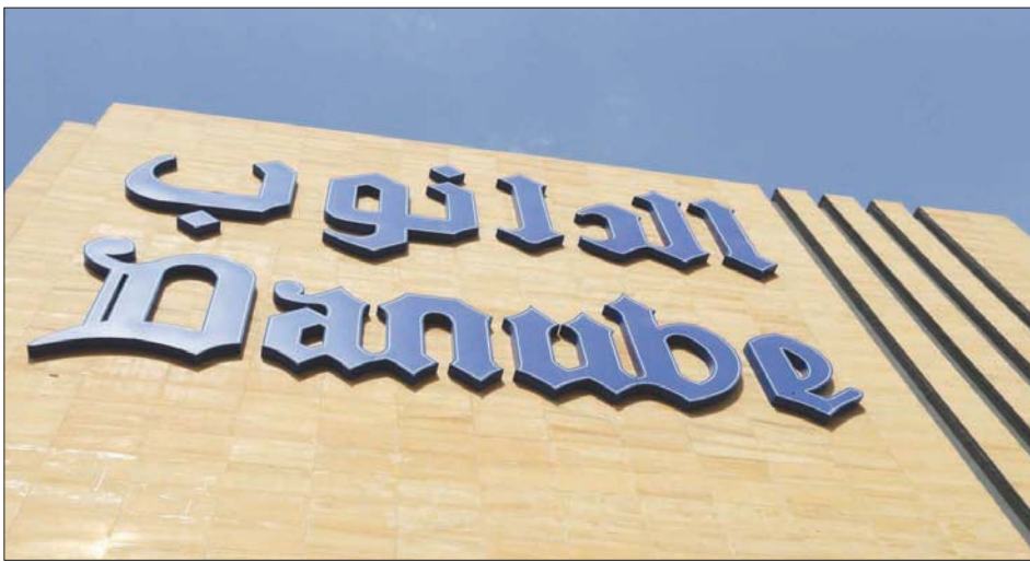
سلسلة التجزئة «الدانوب» من استثمارات «مجموعة بن داود» السعودية المنتظر الاكتتاب فيها قريباً

يذكر أن «شركة بن داود القابضة» السعودية أعلنت عن عزمها بيع 20 في المائة من أسهمها في طرح عام للإدراج في السوق المالية السعودية الرئيسية (تداول) لما مجموعه 22,8 مليون سهم، تمثل 20 في المائة من رأسمال الشركة. في الوقت الذي سيتم فيه توزيع مستحقات الاكتتاب على المساهمين الحاليين.