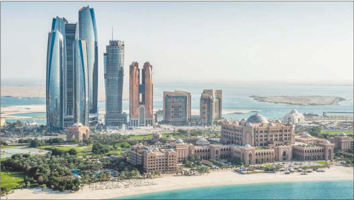
تستضيف العاصمة الإماراتية معرضي الدفاع الدولي «إيدكس» والدفاع البحري «نافدكس» في فبراير 2021