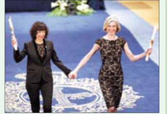
شاربنتييه ودودنا تتلقيان جائزة سابقة (إبأ)