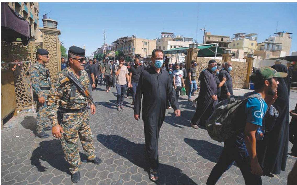
انتشار أمني كثيف في كربلاء أمس

عن 50 زائراً قرب ضريح الحسن، وهاجم زعيم ميليشيا «عصاف الحق» المالية لإيران، قيس الخزعلي، جماعات الحراك، واعتبر أن ما حدث في كربلاء «تشويه ومحاولة لإيجاد فتنة وأمر مؤسف وعزّل للغاية». بدوره، علق النائب فائق الشيخ علي، المعروف بدعمه للحراك الاحتجاجي، على الأحداث التي شهدتها كربلاء عبر «تويتر» قائلاً للمحتجين إن «ميليشيات كانت مستعدة ومتهيئة لقمعكم وطردكم» من الزيارة، «وإلا فكيف أقمض عليكم الآلاف منهم في ثوان؟ ولماذا يحلون الهراوت في أيديهم؟». وأضاف أن «مناكم الحقيقيين ساحات التظاهر يوم 25 أكتوبر (تشرين الأول) وليس العتبة الحسينية».