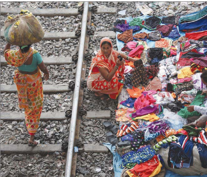
40 المرحج أن يؤثر الفقر المدقع على ما بين 9,1 و9,4% من سكان العالم السنة الحالية بحسب البنك الدولي (رويترز)

المؤشرات، منها إمكانية الحصول على التعليم والبنية التحتية الأساسية. ورغم أن أقل من 10 في المائة من سكان العالم يعيشون على أقل من 1,90 دولار للفرد في اليوم، فإن نحو ربع سكان العالم يعيشون دون خط الفقر البالغ 3,20 دولار، ويعيش أكثر من 40 في المائة من سكان العالم - أي نحو 3,3 مليار نسمة - دون خط الفقر البالغ 5,50 دولار للفرد في اليوم.