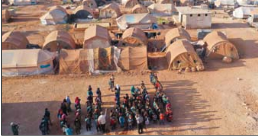
صورة جوية لتلاميذ سوريين نازحين في ريف إدلب

«تحفظات» على الحديث الخاص بـ«إعمار البنية التحتية»، ذلك أن موقف الدول الأوروبية وأمريكا يقوم على ربط المساهمة بالإعمار بـ«تنفيذ عملية سياسية ذات صدقية، في وقت قدر خبراء سوريون خسائر الاقتصاد السوري خلال تسع سنوات من الحرب بنحو نصف تريليون دولار أميركي. وتم التعبير عن هذا الموقف في بيانات مؤتمر المنحصر في بروكسل الذي يعقد في ربيع كل عام. وفي المقابل، ظهر انقسام بين ممثلي