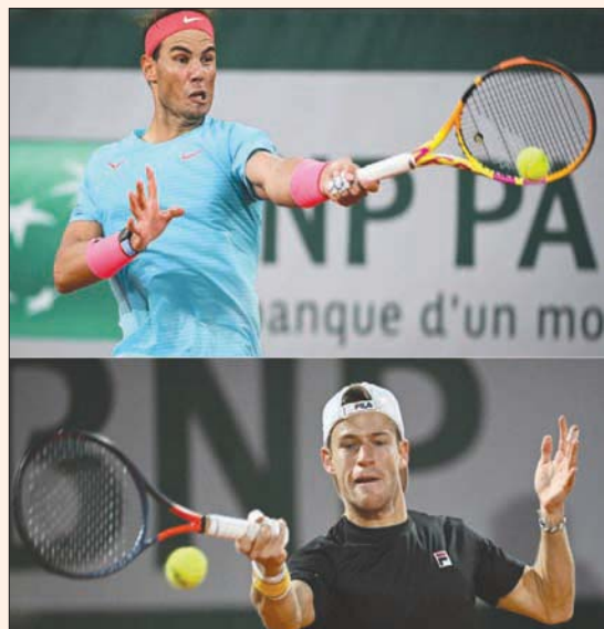
نادال (أعلى) وشفارتزمان وجهاً لوجه اليوم بنصف النهائي

تأهلت الأميركية صوفيا كينن المصنفة رابعة إلى الدور نصف النهائي لبطولة فرنسا المفتوحة (رولان غاروس) للتنس بتغلغها على مواطنها دانييل كولينز 4-6 و6-4 و0-6، أمس، فيما ينتظر الإسباني رافائيل نادال مواجهة ثارية اليوم مع الأرجنتيني ديفغو شفارتزمان بقبل النهائي، وأكدت كينن بطلّة أستراليا المفتوحة والبالغة من العمر 21 عاماً، أنها مرشحة قوية للقب حيث ستخوض نصف النهائي مع التشيكية بترافيتو الفائزة بدورها على الألمانية لورا سيغمووند. وبلغت كفيثوفا الدور نصف النهائي للمرة الأولى منذ ثمان سنوات، بعد فوزها على سيغمووند 3-6 و6-3. وكانت كفيثوفا بلغت الدور نفسه للمرة الأولى عام 2012، وخسرت أمام الروسية ماريا شارابوفا التي توجت بلقب تلك النسخته.