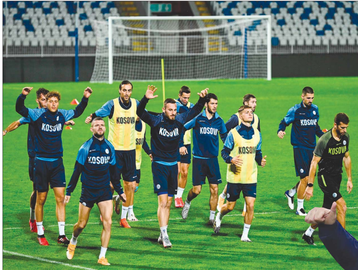
لاعبو منتخب كوسوفو يعرفون أن الفوز على الجارة مقدونيا الشمالية سيقرّبهم جداً من البطولة القارية (أ.ف.ب)

يخوض 16 منتخباً المنافسة على أربعة مقاعد شاغرة في نهائيات كأس أمم أوروبا التي تم تأجيلها سنة كاملة جراء تداعيات فيروس «كورونا» المستجد، فيرمو ماehl 20 منتخبا (بطل ووصيف لعشر مجموعات) عبر التصفيات الأساسية، سيتم تحديد المنتخبات الأربعة المتبقية من خلال ملحق فاصل اليوم، وأدى انتشار «كوفيد - 19» إلى تعطيل الحياة الرياضية حول العالم بما في ذلك كرة القدم، ما دفع الاتحاد القاري (يويفا) إلى تأجيل البطولة المقررة في 12 مدينة أوروبية بين 12 يونيو (حزيران) و12 يوليو (تموز) المقبل. لم تنجح أيسلندا في حجز مكان لها في كأس أوروبا 2021، ويبرود الحلم لمنتخبات اسكوتلندا وأيرلندا والمجر ورومانيا بشكل خاص نظراً لأن دولها تشارك في استضافة مباريات هذه النسخته، وتتنافس المنتخبات الـ 16 التي لم تنجح بالتأهل عبر الملحق، بحسب ترتيبها في