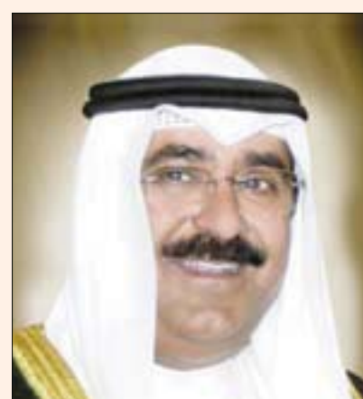
الشيخ مشعل الأحمد

برتبة عقيد منذ عام 1967 وحتى عام 1980، وقد تحولت المباحث العامة في عهده إلى إدارة أمن الدولة وظل رئيساً لجهاز أمن الدولة نحو 13 عاماً بعدما انضم إلى وزارة الداخلية في الستينات من القرن الماضي. وفي 13 أبريل (نيسان) 2004 عينه الأمير الراحل الشيخ جابر الأحمد نائباً لرئيس الحرس الوطني بدرجة وزير.