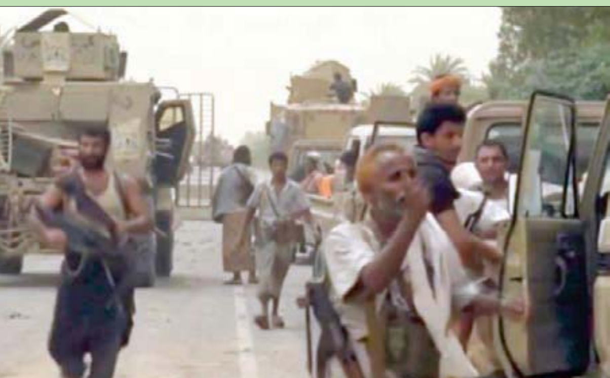
عدن - الرياض، «الشرق الأوسط»

واصلت الميليشيات الحوثية أمس (الأربعاء) لليوم السادس على التوالي شن هجماتها في أنحاء متفرقة من محافظة الحديدة، ضمن مساعيها التصعيدية وخرقها للهدنة الأممية المبرمة بموجب «اتفاق استوكهولم» أواخر العام 2018.