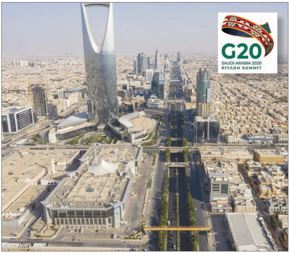
مجموعة الأعمال تعمل على رفع 25 توصية رئيسية لسياسات الأعمال لقمة قادة العشرين في نوفمبر المقبل... وفي الإطار شعار قمة الرياض المنتظرة (أ.غ.ب)

كوكب الأرض من خلال تسريع العمل والقضاء على الانبعاثات الكربونية»، وقال «نعمل على تعزيز نظام طاقة لتكون أكثر نظافة واستدامة، وحرصنا على أن يكون هناك دعم للبنية التحتية لتحديد آثارها على التغير المناخي، والتحول إلى الاقتصاد الدائري التي تقوده وزارة الطاقة في السعودية. هذا من الأساسيات التي تم التوصية بها لقادة العشرين». ولفت إلى حرص المجموعة على التوصية بالتنوع الاقتصادي في القطاعات المولدة لفرص العمل كقطاع السياحة وسياسات داعمة لحرية التجارة ما بين الدول للاستفادة مكامن التنافسية ما بين العالم بشكل عام، إضافة إلى استثمار بعض التوصيات لتبني تطورات التكنولوجيا وتعزيز ثقافة النزاهة التي تعد محورا مهماً جداً في مجموعة العشرين في المملكة، حيث إن السعودية كانت منذ عشر سنوات هي المؤسس لمجموعة ثقافة النزاهة والامتثال.