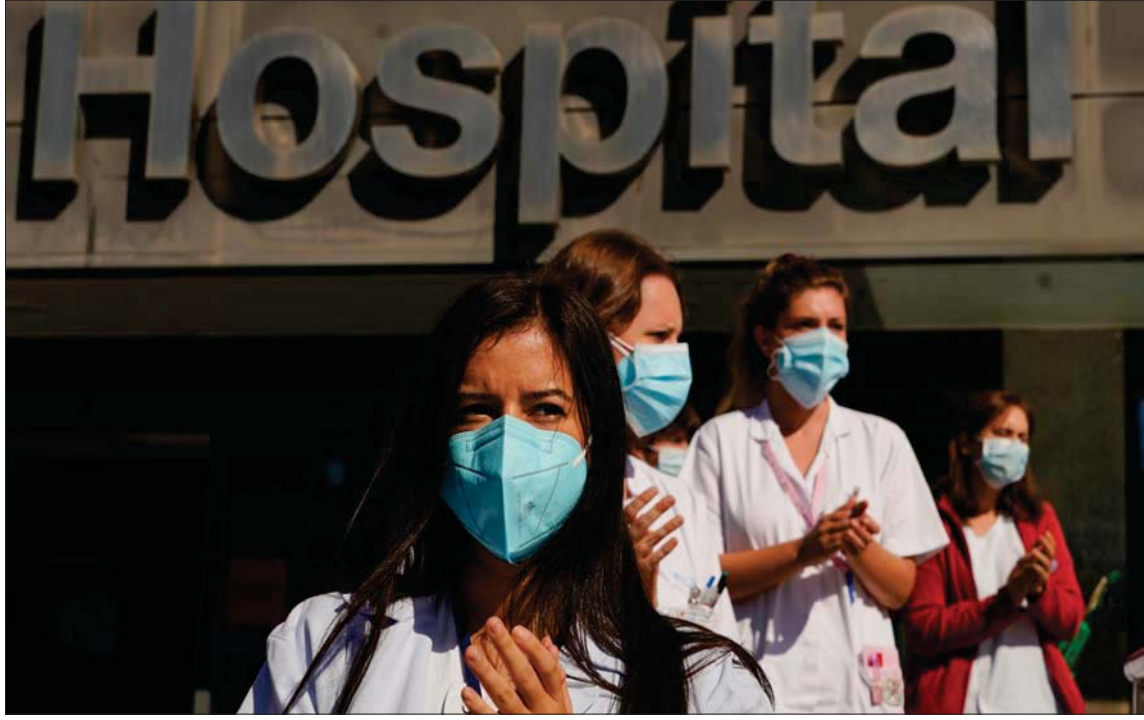
أفراد من طاقم طبي بمستشفى في مدريد التي شددت القيود للحد من انتشار «كورونا»

أعدت جمهورية التشيك فرض حالة الطوارئ مع فرض قيود على الحركة والتجمعات الاجتماعية بالإضافة إلى الإزام بإرتداء الكمامات في الأماكن المفتوحة ووسائل النقل العام.