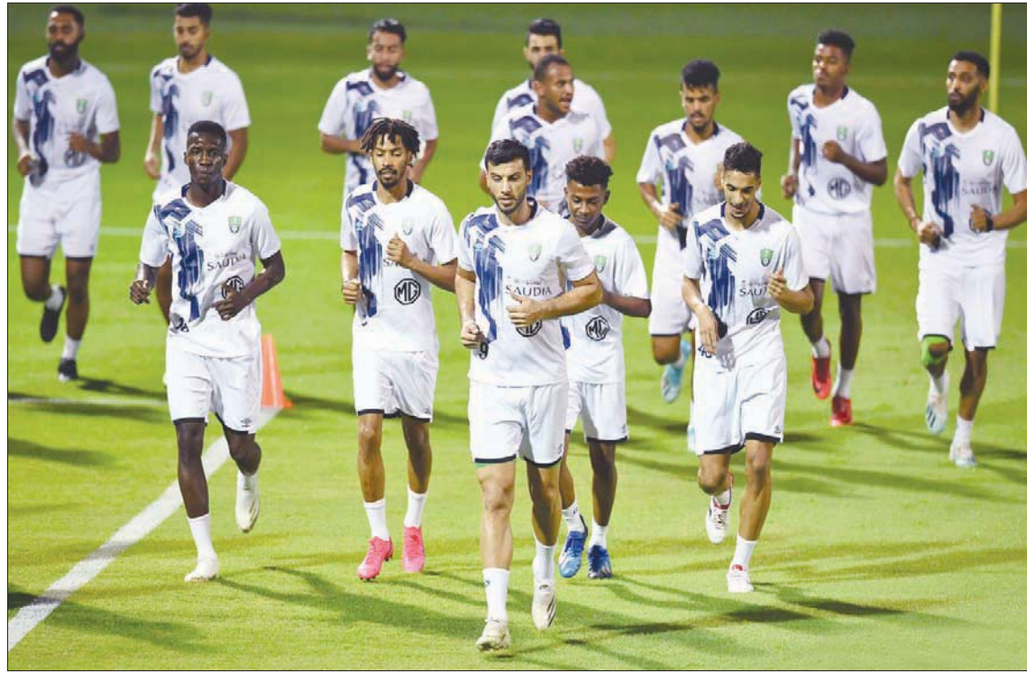
من تدريبات الأهلي استعداداً للموسم الجديد

بالباطن في الجولة الأولى لدوري كاس الأمير محمد بن سلمان للمحترفين في 18 أكتوبر (تشرين الأول) خارج أرضه، بينما سيستضيف فريق الوحدة في الجولة الثانية، وذلك قبل