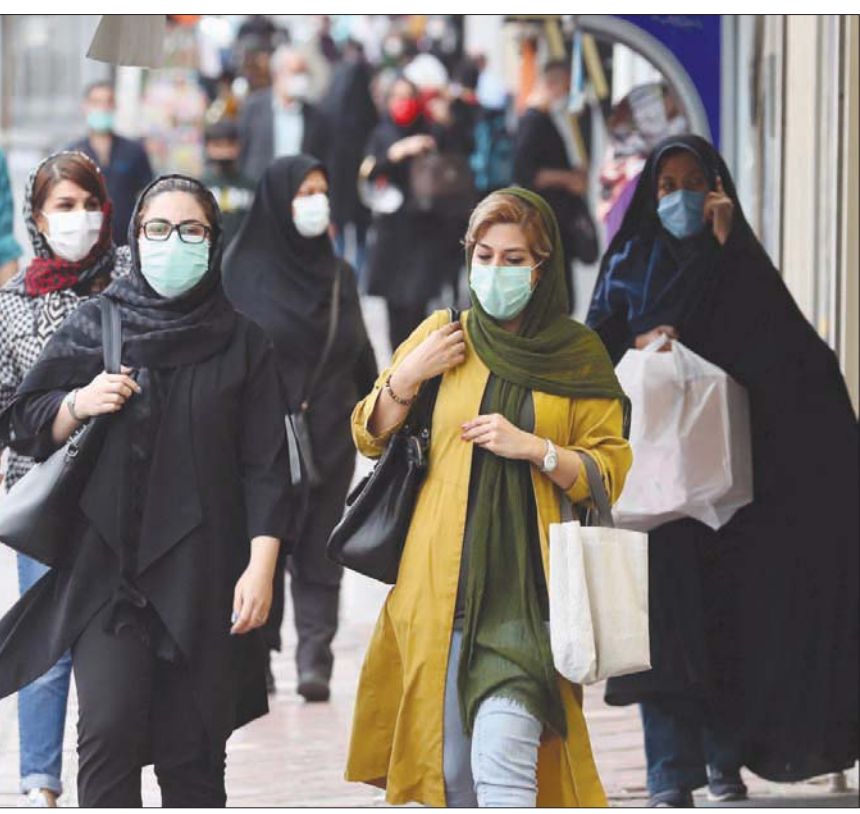
إيرانيون يرتدون كمامات في شارع بوسط طهران أول من أمس