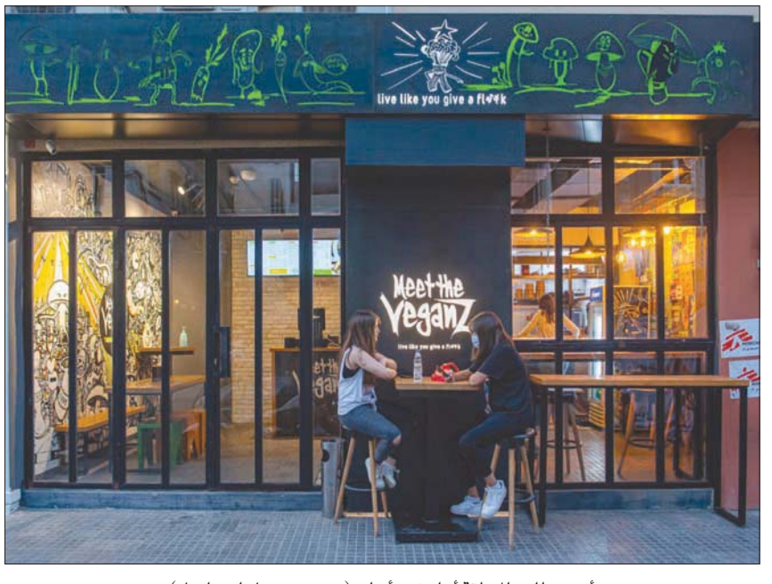
أحد مطاعم المنطقة أعاد فتح أبوابه