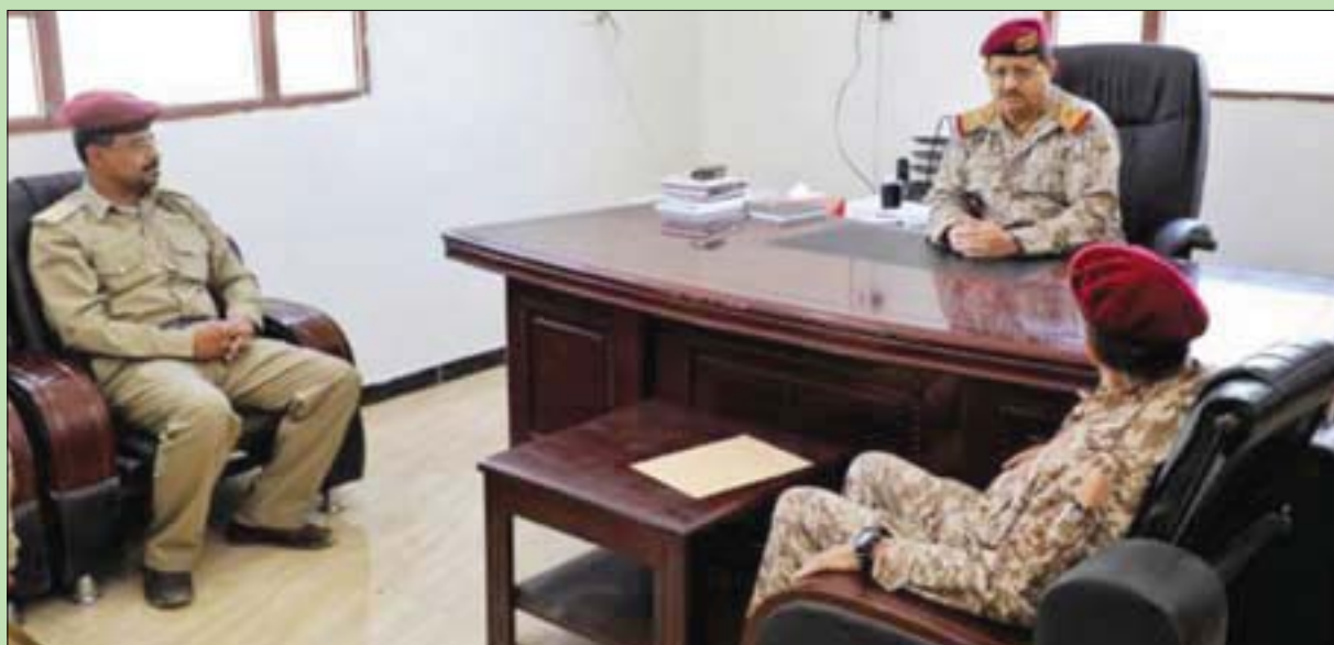
وزير الدفاع اليمني الفريق الركن محمد القدسي خلال زيارته دائرة القضاء العسكري بمقرها المؤقت في مأرب أمس

بأعمال قائد المنطقة العسكرية الثالثة في الجيش اليمني، اللواء الركن ناصر الذيباني، أن قوات الجيش في المنطقتين العسكريتين الثالثة والسادسة تواصل التقدم وتحقيق الانتصارات النوعية والاستراتيجية، والتي بدأت باستعادة معسكر الخنجر المهم، والذي يتحكم في مناطق شاسعة من مساحات مديرية خب والشعف، مشيراً إلى أن الميليشيا مُنبت بهزيمة ساحقة، وإلى أن قتلها بالعشرات جراء الضربات المحكمة للجيش والمقاومة. ونقل الموقع الرسمي للجيش عن الذيباني قوله «إن العمليات العسكرية مستمرة في المحور الشمالي محافظة الجوف، حتى اكتمال مهامها، وإن عناصر الجيش يقتربون من منطقة صبرين، وأن الجاهزية مكتملة والانتصارات أضافت لهم معنويات أكثر للتحرك على قلوب الميليشيا الحوثية المتطردة». وأوضح الذيباني «أن قوات الجيش في المنطقة العسكرية