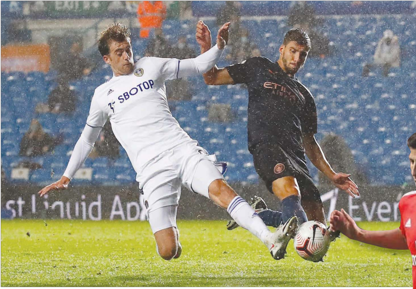
دياش (يمين) يشارك للمرة الأولى مع مانشستر سيتى أمام ليدز

وعانى مانشستر سيتى من مشكلات دفاعية الموسم الفائت، فبالإضافة إلى إصابة الفرنسي إيمريك لاپورت، وغيباه مدة طويلة عن الملاعب، تراجع مستوى أوتاميندى وجون ستونز، فى حين ترك قائد الفريق الالماني كومانى فراغاً كبيراً فى الخلفى، واضطر غوارديولا إلى إشراك لاعب الوسط الدفاعى البرازيلى فرناندينيو فى مركز قلب الدفاع مرات عدة. ويمتلك دياش خبرة دولية جيدة، حيث لعب 19 مباراة مع منتخب البرتغال، وحصل على لقب أفضل لاعب فى المباراة النهائية لدورى الأمم الأوروبية الصيف الماضى، وهو ما يعنى أن اللاعب البرتغالى الشاب يملك كل المقومات التى تؤهله للتألق فى صفوف مانشستر سيتى.