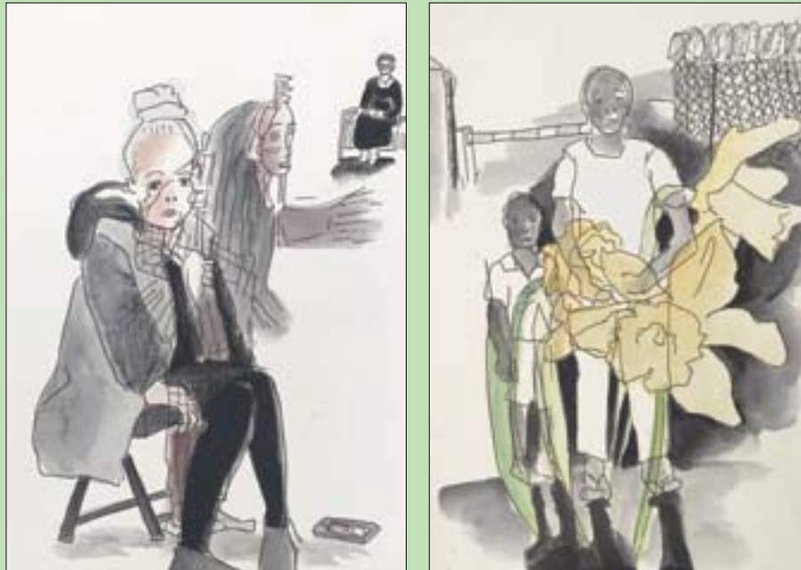
من أعمال المعرض