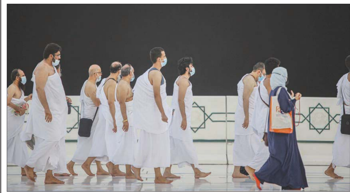
صورة وزعتها وزارة الحج السعودية لمعتنمين يلتزمون إجراءات الوقاية لمنع انتشار «كورونا» (إ.ب.أ)