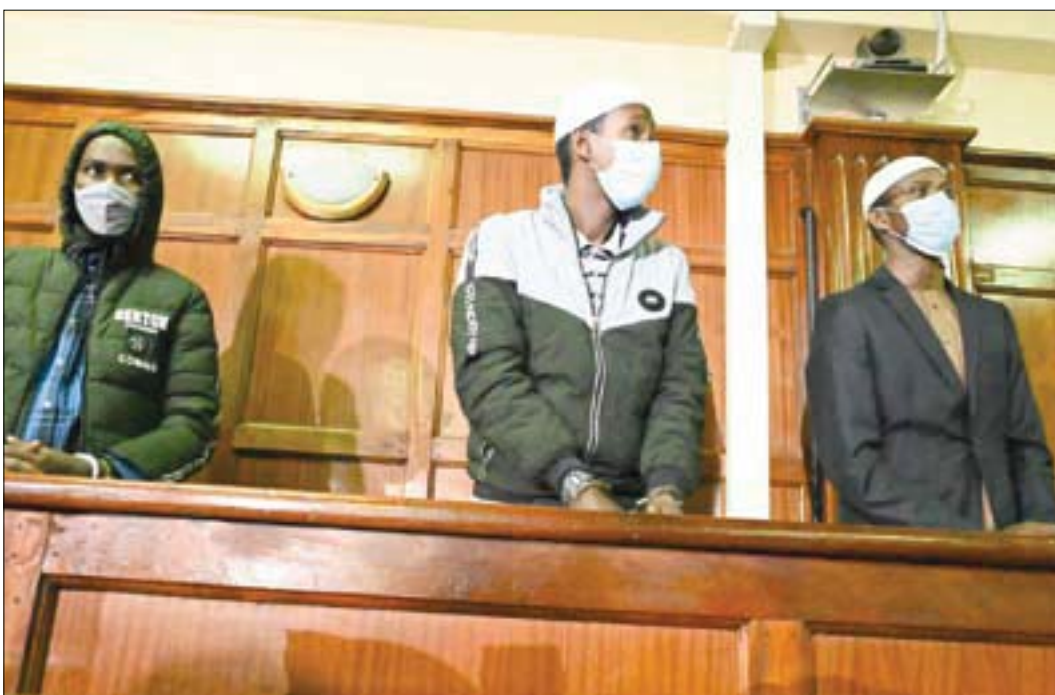
المتهمون الثلاثة خلال محاكمتهم في نيروبي

نيروبي، «الشرق الأوسط» نمطاً «يتعارض مع احتمال كونهم مجرد اصداق».