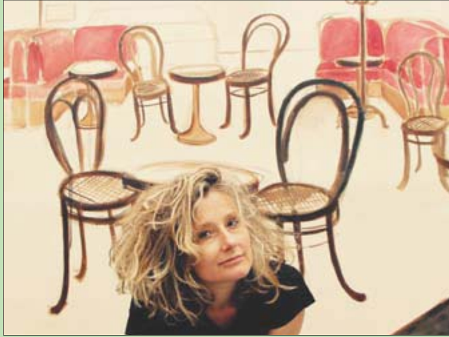
الفنانة النمساوية باربارا فيليب