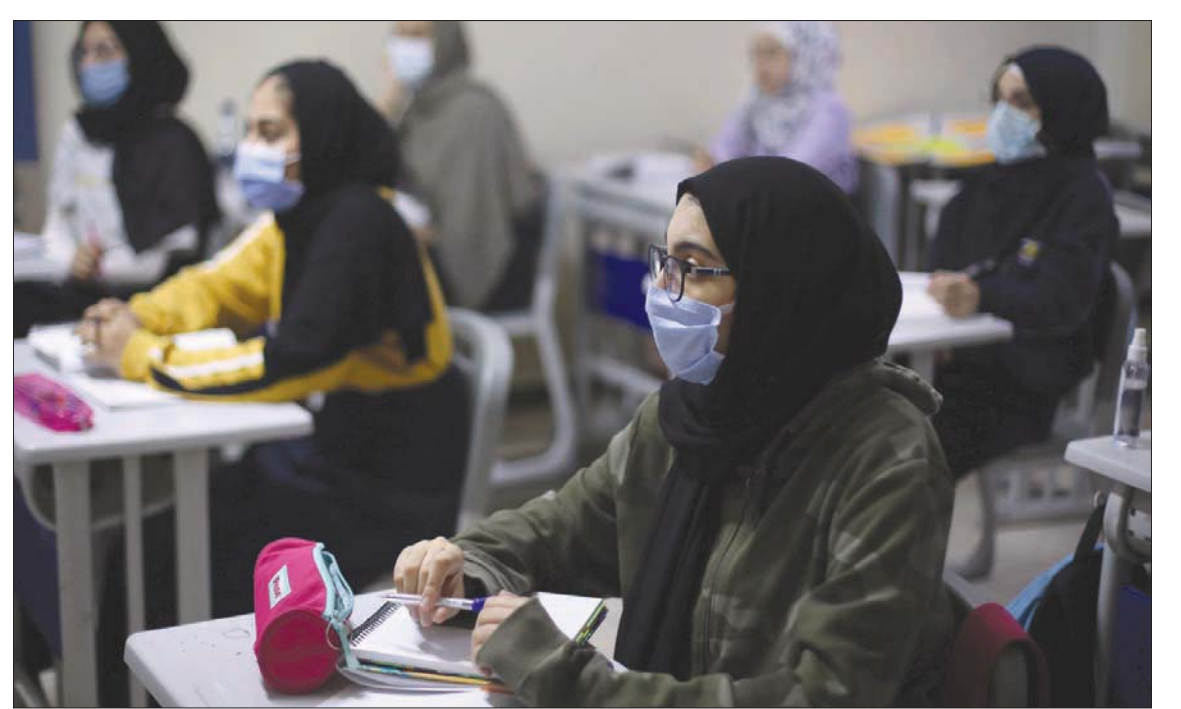
طالبات في مدرسة خاصة في العاصمة الأردنية عمان أمس

كل أسبوع يأتي لمواجهة المخالفات المتكررة للبيض الذين يصرون على التحضير لحفلات الأعراس داخل مزارع خاصة، في وقت تكررت فيه المخالفات داخل المساجد خلال صلاة الجمعة الماضية، من حيث عدم الالتزام بالتباعد الجسدي، واتخاذ إجراءات الوقاية. وكانت الحكومة الأردنية غلّقت العقوبات على المخالفين بشروط السلامة العامة لمواجهة فيروس «كورونا» الذي انتشر على نطاق واسع في مناطق المملكة المختلفة، وذلك مع عودة فتح المساجد ودور العبادة والمطاعم. وأعلنت الحكومة على لسان وزير الإعلام أمجد العضايلة، في وقت سابق، أمر الدفاع رقم 17 لسنة 2020م، الذي تمّ بموجبه تعديل أمري الدفاع رقمي 8 و16 لتغليظ