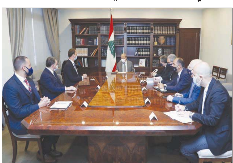
عون مجتمعاً أمس مع أعضاء شركة التدقيق في حسابات مصرف لبنان (الداخلي ونهرا)

بيروت، «الشرق الأوسط» شدد رئيس الجمهورية ميشال عون على ضرورة التوصل إلى نتائج حاسمة ودقيقة وواضحة معرّزة بالمستندات والأدلة الثبوتية في نتائج التدقيق الجنائي في الحسابات المالية لمصرف لبنان، لأن هذا التدقيق هو من الإصلاحات الأساسية التي أقرتها الحكومة اللبنانية للتحقق من الأوضاع المالية والاقتصادية الصعبة التي يمر بها لبنان. ولفت عون الوفد إلى «ضرورة التوصل إلى نتائج حاسمة ودقيقة وواضحة معرّزة بالمستندات والأدلة الثبوتية» داعياً أعضاء الوفد إلى مراجعته «في حال وجد فريق التدقيق أي صعوبات في العمل، ليصار