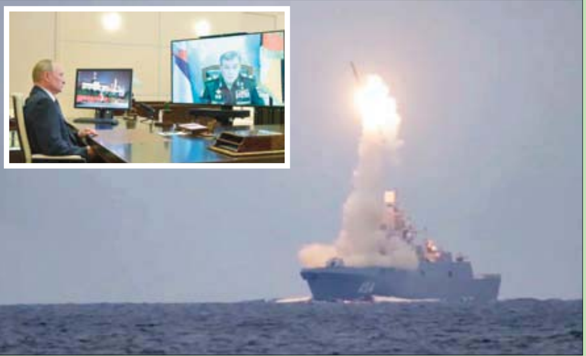
صورة وزعتها موسكو تظهر تجربة إطلاق صاروخ تسيركون، وهو صاروخ كروز تفوق سرعته سرعة الصوت، في بحر بارنتس، أمس، في عيد ميلاد الرئيس فلاديمير بوتين. وفي الإطار، بوتين متحدثاً إلى رئيس هيئة أركان القوات المسلحة فاليري جيراسيموف عبر الفيديو أمس

روسيا تختبر صاروخاً أسرع من الصوت في عيد ميلاد بوتين