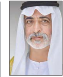
نهيان مبارك آل نهيان*