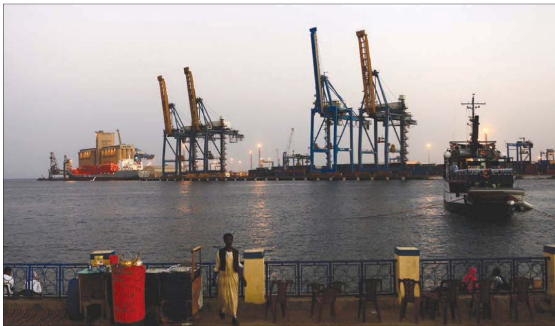
ميناء بورتسودان على البحر الأحمر

وشمل الاتفاق كذلك إنشاء صندوق إعمار بمول محلياً، وبنك أهلي يستقطب تمويلاً من الداخل والخارج، وإقامة مشروعات تنموية تزيل التهميش بالإقليم.