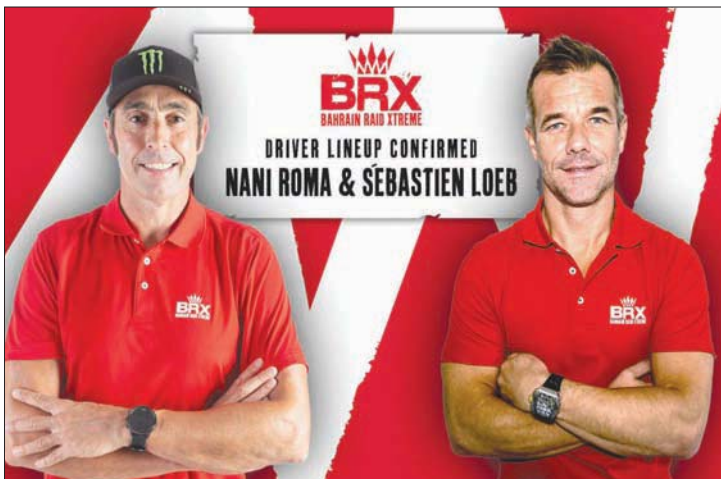
سبستيان لوب وناني روما فثنائي فريق البحرين في رالي داکار السعودية الشرق الأوسط

في قيادة فريق «فورمولا 1». ومع ذلك، ستكون هذه مشاركته الأولى في تاريخ مملكة البحرين، بعد فريق البحرين رايد إكستريم آخر إنجازات المملكة في عالم رياضة السيارات، ويمثل خطوة جديدة في رحلة المملكة في عالم الرياضة.