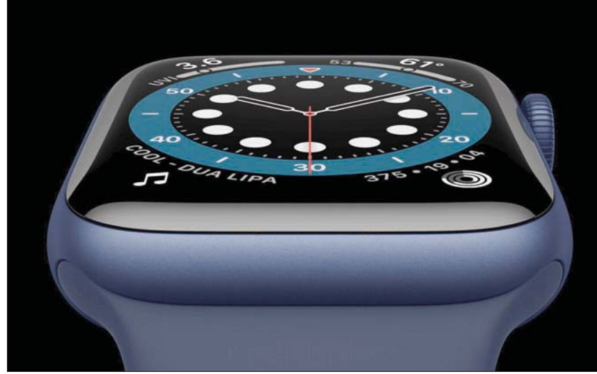
ساعة «آبل سيريز 6» الجديدة تقيس أكسجين الدم

كما يمكن استخدام هذه المعلومات لتحديد ما إذا كان الشخص المريض يجب أن يذهب إلى المستشفى. وقال ويس: «إذا مصاب بالكوفايد - 19 وأن نسبة الأكسجين في دمه انخفضت إلى 80 في المائة، ساوصبه بالتوجه فوراً إلى المستشفى».