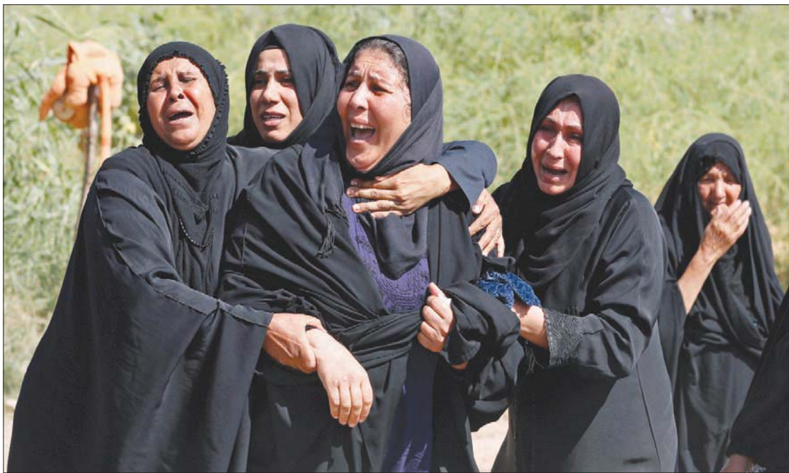
نساء ينتحبن في جنازة أفراد أسرة قتلوا بصاروخ سقط على منزل قرب مطار بغداد الأسبوع الماضي

وفي سياق التخديعات المحتملة لإطلاق الصواريخ بعد هدنة كانت كل المؤشرات تذهب باتجاه صمودها فإن للخبراء المتخصصين رأيهم في هذا المجال. صمود الهدنة وفقاً للتوقعات جاء مع دخول إيران على الخط طبقاً للزيارة التي قام بها إلى إيران مؤخراً وزير الخارجية العراقي فؤاد حسين، فضلاً عن اللقاء الذي جمع أول عبد الأمير يار الله. ورغم التأكيدات الحكومية على العمل بهذا الاتجاه فإن كل الدلائل تشير إلى أن مطّلي صواريخ الكاتوشا لا يزالون هم من يخطرون توقيت إعلان الحرب أو إيقافها برغم إعلان الرئاسات العراقية الثلاث بل نحو أسبوع أنها وحدها من تمكّن قرار الحرب من عدمه وليس أي طرف آخر.