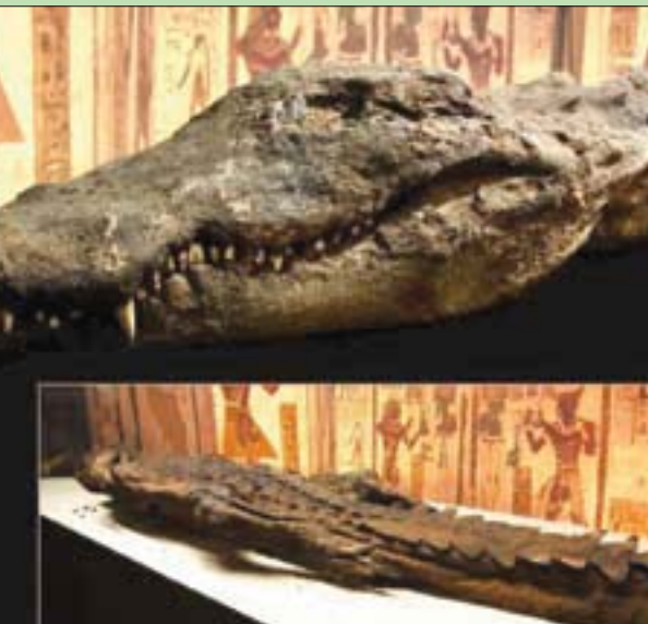
مومياء التمساح محل الدراسة

مصر (1798 - 1801)، جمع هيلير مجموعة متنوعة من موميאות الحيوانات بما في ذلك القبط وابو