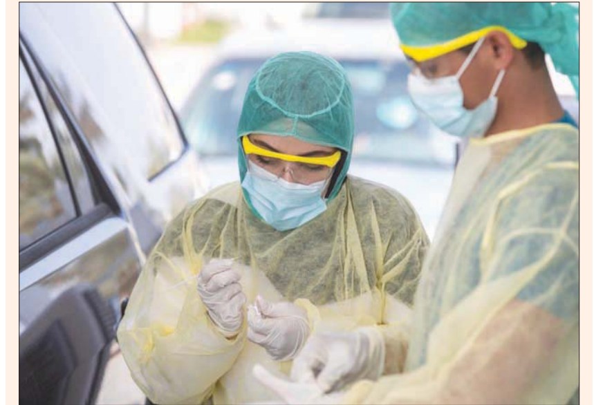
موظفون صحيون أثناء أخذ مسحات لاختبار الإصابة بـ«كورونا»

الرياض، محمد العايض انخفض معدل الإصابات النشطة في السعودية إلى ما دون الـ10 آلاف حالة، في تواصل لاستقرار الوضع الصحي ضمن احترازمات مكافحة فيروس كورونا المستجد. وأعلنت وزارة الصحة السعودية، أمس، عن تسجيل 570 حالة تعافٍ جديدة، ليصل عدد المتعافين إلى 322 ألفاً و55 حالة. فيما يتعلق بالكويت، أعلن عن تسجيل 567 إصابة جديدة، ليترفع العدد الإجمالي لعدد الحالات المسجلة إلى 107 آلاف و592 حالة، في حين سُجّلت 4 حالات وفاة إثر إصابتها بالمرض، ليصبح مجموع حالات الوفاة المسجلة حتى اليوم 628 حالة.