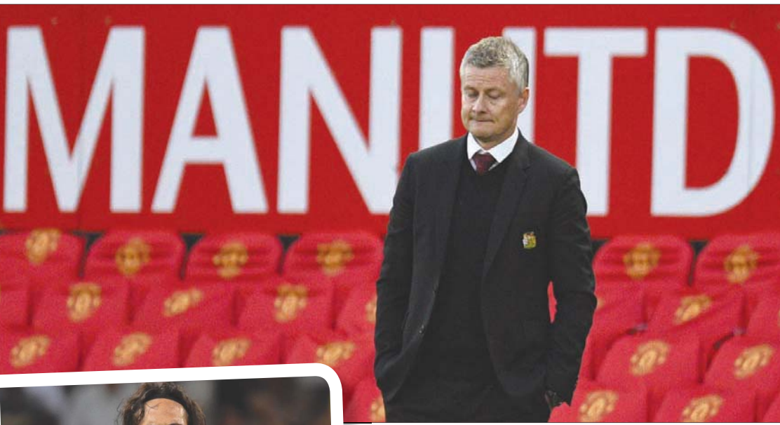
الشكوك باتت تحيط بسولسكاير وقدرته على حل أزمت فريق يونايتد

والآن وبعد الخسارة القاسية أمام توتنهام، قد تلجأ الإدارة إلى مدرب سابق للنادي اللندني هو الأرجنتيني