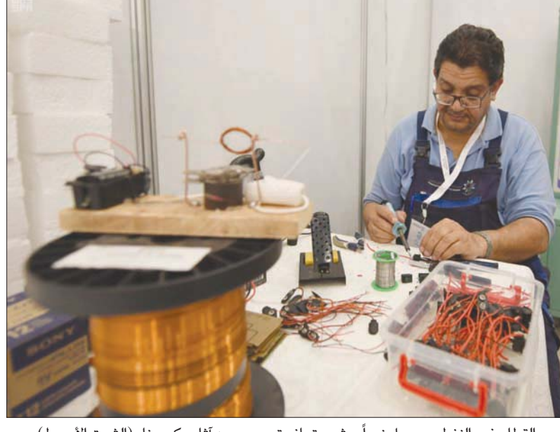
القطاع غير النفطي يسجل نمواً يبيسر بتعاقد تدريجي من آثار «كورونا» (الشرق الأوسط)

بتوطين مهن الاتصالات وتقنية المعلومات، حيث سيسري القرار على جميع المنشآت في سوق العمل التي يعمل بها 5 عاملين فأكثر في وظائف هندسة التطبيقات وتقنية المعلومات، وتطوير التطبيقات والبرمجة والتحليل، والدعم الفني والوظائف الفنية للاتصالات. وتطمح الوزارة إلى توفير 9 آلاف فرصة وظيفية في مجال الاتصالات وتقنية المعلومات، وتحفيزه للنمو، وحددت الأجر المحتسب في توطين وظائف الاتصالات وتقنية المعلومات المستهدفة بحيث يبدأ من 17 ألف ريال (1800 دولار) للمهن التخصصية، و5 آلاف ريال (1300 دولار) للمهن الفنية. وإجراءات تنفيذها على نحو أكثر تفصيلاً، حيث يمكن لأصحاب المنشآت والباحثين عن عمل الإطلاع على الدليل الإجرائي بزيارة الموقع الرسمي للوزارة.