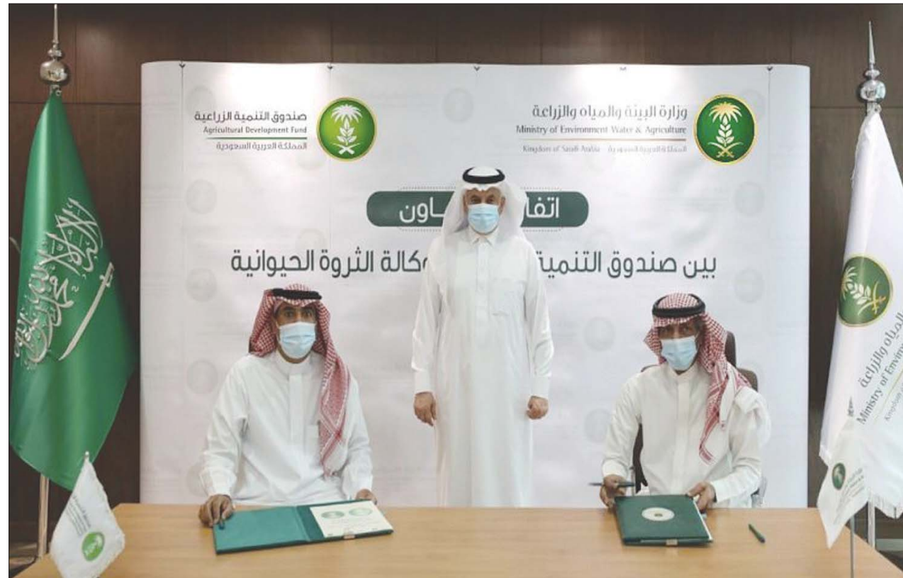
وزارة البيئة والمياه والزراعة السعودية تبرم اتفاقية لرفع كفاءة الإنتاج الحيواني (الشرق الأوسط)