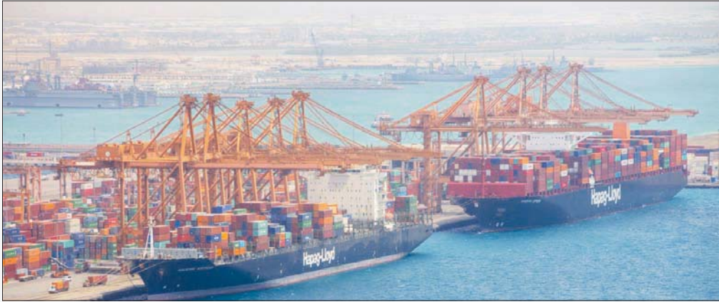
السعودية تشهد نقلة نوعية في تطوير الموانئ واللوجستيات (الشرق الأوسط)

وفي ظل الجائحة العالمية، مضيفاً أنها خطوة إيجابية ستكون حافزاً في تسريع التطورات لرفع مستوى الميناء وقدرته لدعم مبادرات النمو الصناعي وفق «رؤية المملكة 2030».