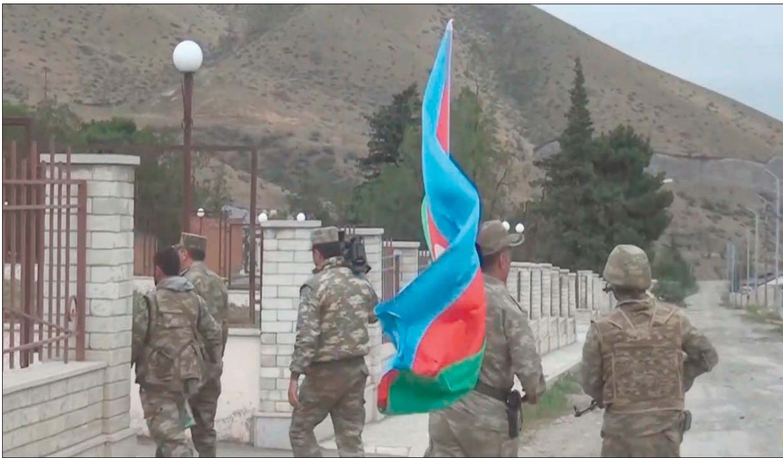
صورة وزعتها وزارة الدفاع الأذربية تظهر قواتها مسيطرة على قرية تاليف غير المسكونة (إ. ب.أ)