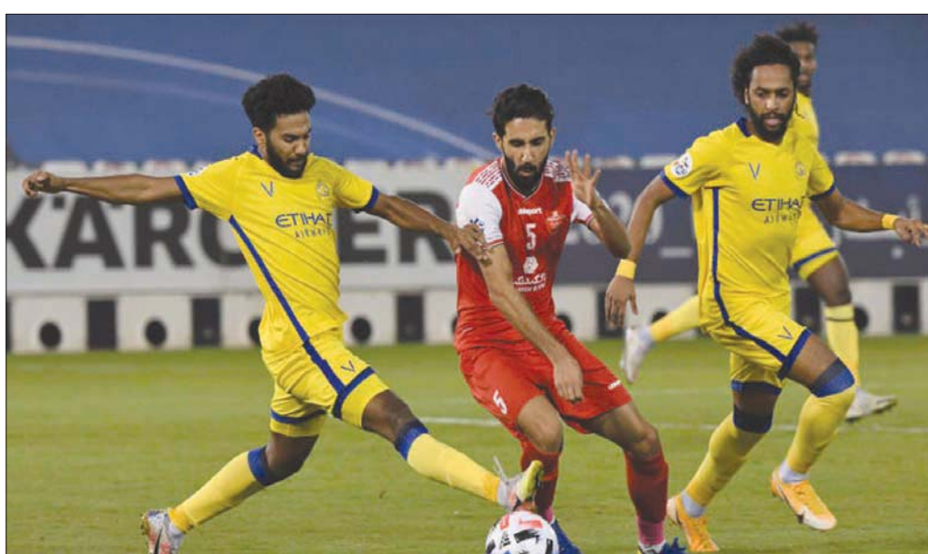
النصر يامل كسب الاحتجاج ضد بيرسيوليس وأن يحل مكانه في نهائي أبطال آسيا