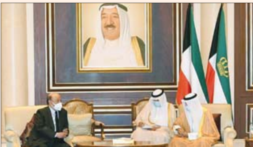
أمير الكويت يستقبل الرئيس اليمني الذي قدم تعازيه أمس (الديوان الأميري)