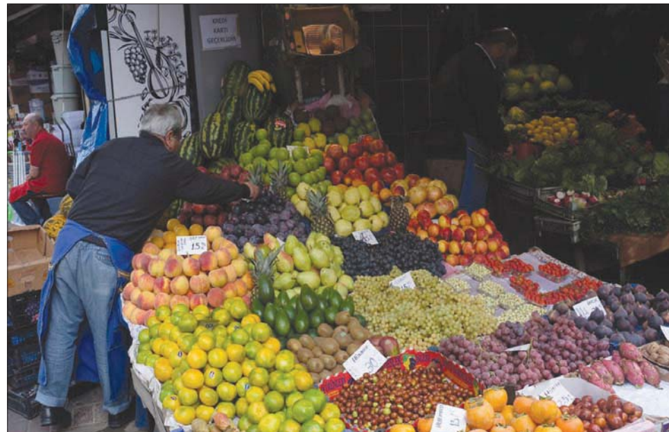
استمر التضخم التركي في مساره المرتفع الشهر الماضي رغم محاولات البنك المركزي تخفيف الضغط على الليرة

على العملة التي استردت هامشاً من خسائرها عقب صدور القرار.