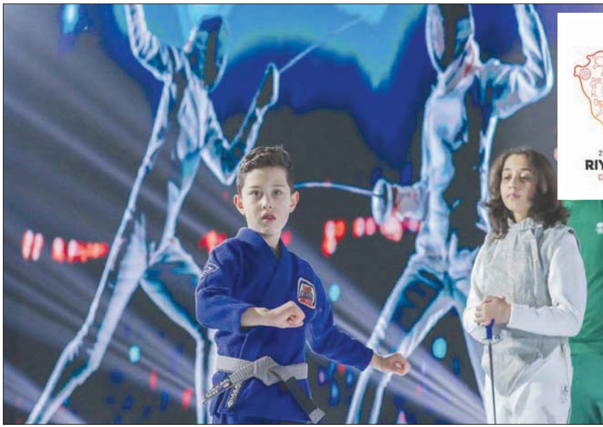
جانب من حملة الترشح الرسمية أمس لاستضافة الرياض للالعاب الآسيوية 2030