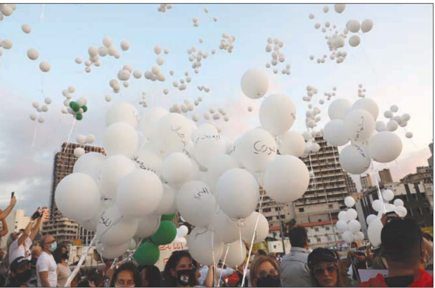
لبنانيون يطلقون بالونات في مرفأ بيروت للتذكير بمرور شهرين على الحادث

واستندت الرئاسة إلى رأي هيئة التشريع والاستشارات في الصيغة التي يقتضي اتباعها، في إصدار مثل هذه المراسيم، وتم وصف القرار بالقرار المبدئي أو المرجعي، الذي لا يعني عن صدور مراسيم فردية اسمية عن مجلس الوزراء، وقررت الرئاسة أنه «عملاً بأحكام الدستور والقوانين المرعية، لن يقدم رئيس الجمهورية على توقيع أي من مشاريع المراسيم هذه، طالما أنه لم تصدر قرارات بشأنها اسماً وفردياً من مجلس الوزراء».