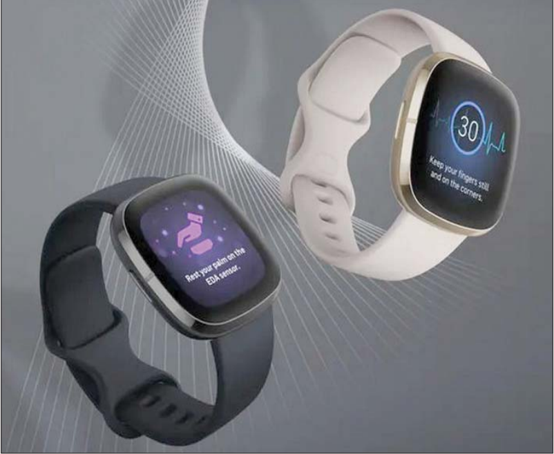
ساعة «سينس» الجديدة

مع جهاز GPS مدمج لتتبع وتقنية قراءة النبض ومكبر صوت مدمج لتلقي الاتصالات من المعصم. وأضافت «فيتبت» على «فيرسا» خاصية استخدام مساعد غوغل الافتراضي والبكسا من أسازون، ليتمكن المرئدي من التواصل مع ساعته الذكية بالطريقة نفسها التي يتواصل بها مع هاتفه.