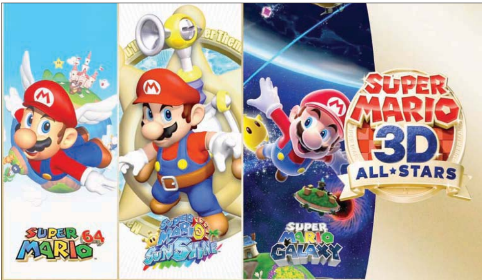
3 ألعاب ثلاثية الأبعاد في مجموعة واحدة

وتجسد الإثارة إلى أن محدود لغاية مارس (آذار) 2021، وستوقف بيع النسخ في المتاجر العادية ومتجرها الرقمي بعد هذا التاريخ. كما ستطلق لعبة Super Mario World 3D على جهاز «سويتش» في 12 فبراير (شباط) 2021، والتي أطلقت سابقاً على جهاز «وي يو»، مع تقديم بعض التعديلات والإضافات.