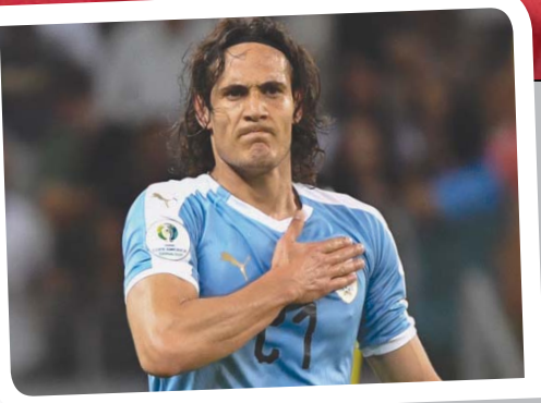
ضم المهاجم كافاني لن يحل مشكلات يونايتد الدفاعية

تيليس من بورتو البرتغالي، والمهاجم الأوروغوياني إيديسون كافاني الذي لا يرتبط إيديسون كافاني الذي لا يرتبط