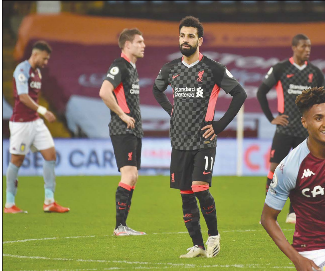
صلاح بين لاعبي ليفربول المصدرين من الهزيمة القاسية أمام فيلا بسبعة أهداف