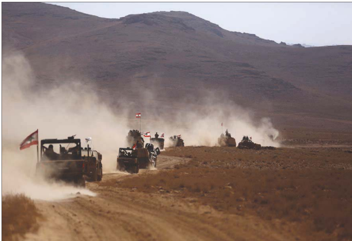
قوات الجيش اللبناني قرب الحدود مع سوريا تطارد «داعش» في 2017

بغيب القدرة على وقفها، وبعدم وجود غطاء من القوى السياسية الموجودة في القاع الشمالي يُستخدم لردع المهربين الذين يجنون أرباحاً طائلة، لأن صفيحة البنزين المهربة إلى سوريا تباع بخمسة أضعاف سعرها المدعوم في لبنان. وفي هذا السياق، علمت «الشرق الأوسط» أن هناك جهات محلية بقايعا ترعى التهريب للالتفاف على «قانون قيصر»، وبالتالي لا مصلحة لدمشق في ترسيم الحدود أو في التعاون مع السلطات اللبنانية لوقف عمليات التهريب المنظمة باعتبار أن خطوط التهريب تشكل الرئة التي يتنفس منها النظام في سوريا.