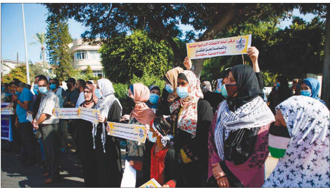
فلسطينيات تظاهرن في غزة أمس ندماً لنزوح المسجونين لدى إسرائيل