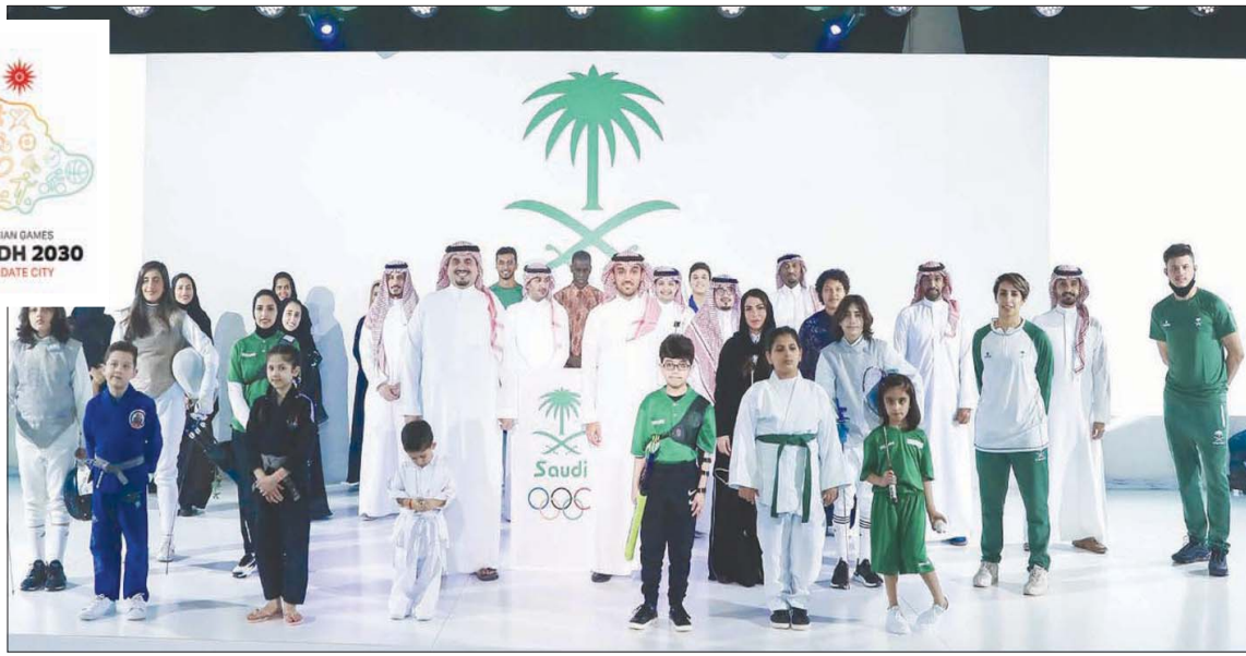
الأمير عبد العزيز بن تركي الفيصل مع مسؤولين ومجموعة من الحضور أمس خلال تدشين حملة استضافة الرياض للالعاب الآسيوية 2030 (وزارة الرياضة السعودية)