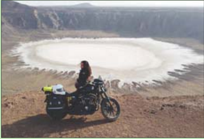
الرحالة أمام الفوهة البركانية بالقرب من المدينة المنورة