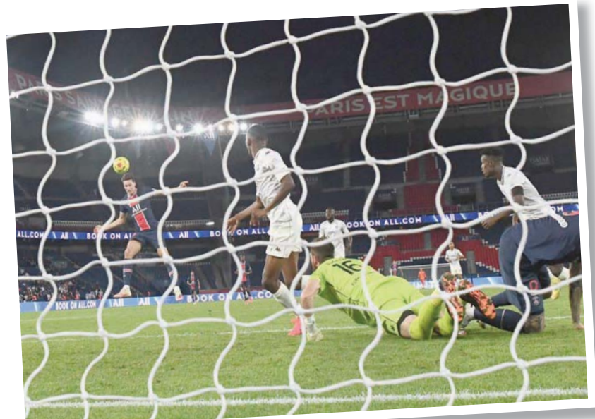
دراكسلر (يسار) يسجل برأسه في الوقت القاتل هدف فوز سان جيرمان في مرمى متز

وستراسبورغ مع ديجون، ومونبلييه مع أنجيه، وبريست مع لوريان ونانت مع سانت إتيان الأحد.