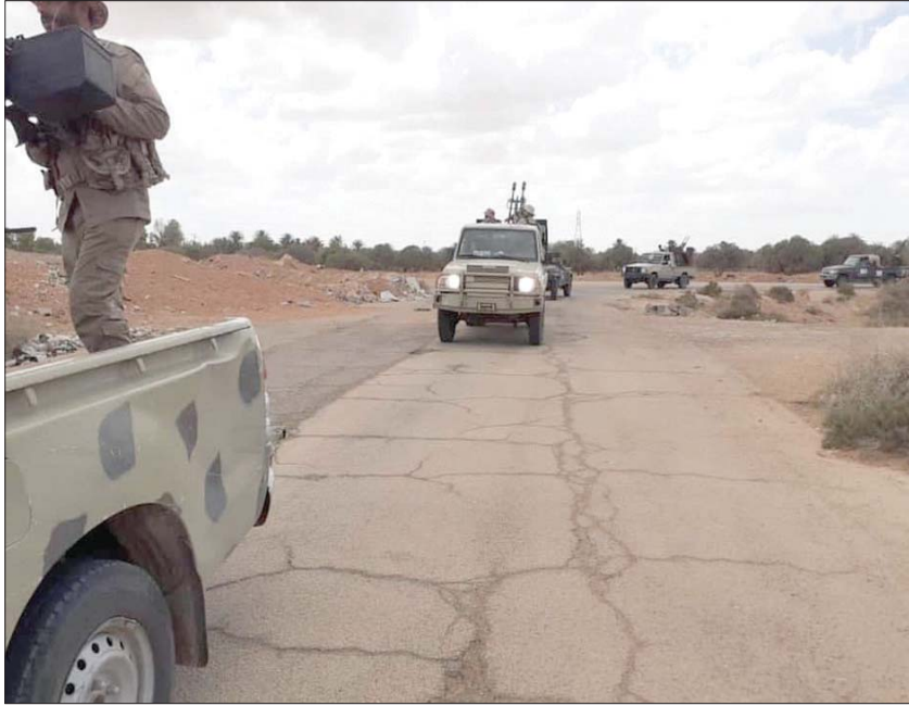
رتل تابع لقوات «الوفاق» ضمن دورية استطلاع في محوري سرت والجفرة (عملية بركان الغضب)

فاغتر «خلفهم»، موضحاً أن فرق البحث عن المفقودين في ترهونة وجنوب طرابلس تكشف عن مقابر مجهولة لشهداء قتلوا بدم بارد. كما أعلنت عملية «بركان الغضب» أن الاجتماع الثالث للجنة العلمية لمركز (5+5) التدريبي، الخاص بإزالة الألغام للأغراض الإنسانية، الذي عقد عبر تقنيات الفيديو، بمشاركة ممثلي اللجان العلمية لدول مبادرة (5+5 دفاع) ناقش ما وصفته بالتحدي الخطير، الذي تواجهه المناطق السكنية جنوب طرابلس بسبب الألغام المزروعة بطريقة عشوائية، وبأساليب خادعة متطورة، ترتقي إلى «جرائم حرب»، وتعد انتهاكا للقانون الدولي والإنساني، لما تسببه من أضرار بيئية واقتصادية واجتماعية وتعوق السلام والتنمية.