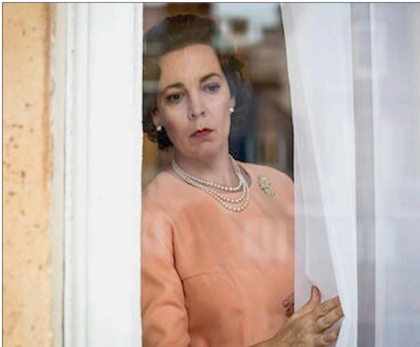
أوليفيا كولن كما تبدو في «ذا كراون»

بالم سبرينغز (ولاية كاليفورنيا)، محمد رضا