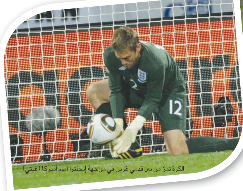
الكرة تمر من بين قدمي غرين في مواجهة إنجلترا أمام أميركا

العمل الجاد فقط، ولم تكن نلتفت إلى أي شيء آخر، نظراً لأننا كنا نعرف جيداً أن إنجلترا باكملها تنتظر ما نقوم به. وبعد 4 سنوات، إن هذا الأمر يسبب مشكلة كبيرة للاعبين، لأنه في كل مرة نقام فيها نهائيات كأس العالم أو كأس الأمم الأوروبية يعتقد اللاعبون أنه يمكنهم