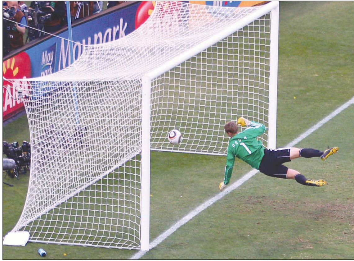
الكرة التي سددها لامبارد تجاوزت خط المرمى لكن حكم اللقاء لم يحتسبها هدفاً

وفي كأس العالم 2010 بجنوب أفريقيا، كان المنتخب الإنجليزي بقيادة كابيلو يضم حارس المرمى روب غرين، الذي ارتكب خطأ فادحاً أمام الولايات المتحدة الأميركية بعدما تعامل بشكل سيئ مع تسديدة كليبت ديمبسي من مسافة بعيدة وسمح للكرة بأن تمر من بين قدميه لتدخل المرمى. وقد تحدث غرين فيما بعد عن ثقافة الخوف وعدم التواصل بشكل جيد، وهي المشكلة التي كانت واضحة للغاية في صفوف المنتخب الإنجليزي