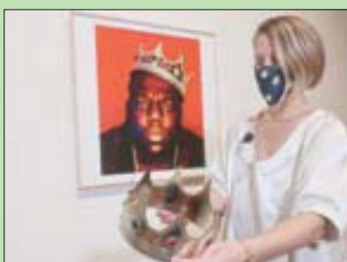
دار «سوديز» تعرض تاجاً بلاستيكيًا لـ«بيغي» في نيويورك

ليما - لندن، «الشرق الأوسط» إقامة طقوس متوارثة للتنبؤ بمن سيفوز بالانتخابات الرئاسية في الولايات المتحدة، استخدم عراقون في بيرو البخور والزهور وصوراً للرئيس الأميركي دونالد ترامب وخصمه الديمقراطي جو بايدن... إلا أنهم اختلفوا على الفائز. وكانوا قد ارتدوا ملابس متعددة الألوان وأنشدوا الأهازيج ونفخوا آلة موسيقية تقليدية وتوجهوا بالدعاء إلى (باتشاماما)، أي الأرض الأم كي تسير الانتخابات الأميركية في أجواء سلمية دون هجمات أو سحر أسود بين الخصمين، حسب «رويترز».