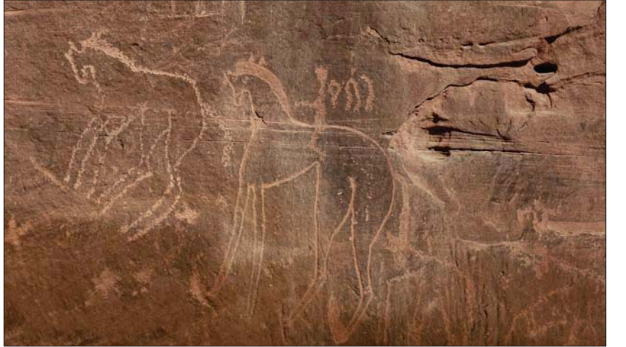
تشتهر محافظة العلا (غرب السعودية) بالمواقع الأثرية والتاريخية وسط جهود جعلها وجهة سياحية رئيسية (الشرق الأوسط)

ووفق بيان صدر أمس، سيتم بناء على خطة العمل المشتركة التي وقعها محافظ الهيئة العامة للمنشآت الصغيرة والمتوسطة «منشآت» المهندس صالح الرشيد والرئيس التنفيذي للهيئة الملكية