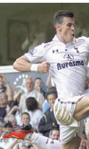
غاريت بيل يقمص توتنهام عام 2013 قبل الانتقال إلى ريال مدريد

من خلال هذه الشراكة، سيطلق الدوري الممتاز قناة رسمية تضم مقاطع فيديو وقرارات خاصة. وقال المدير التنفيذي للرابطة ريتشارد ماسرتن: «نحن متحمسون للتوصل إلى هذه الشراكة مع (تنتست) لضمان أن يتمتع مشجعونا في الصين بمتابعة مباريات الدوري