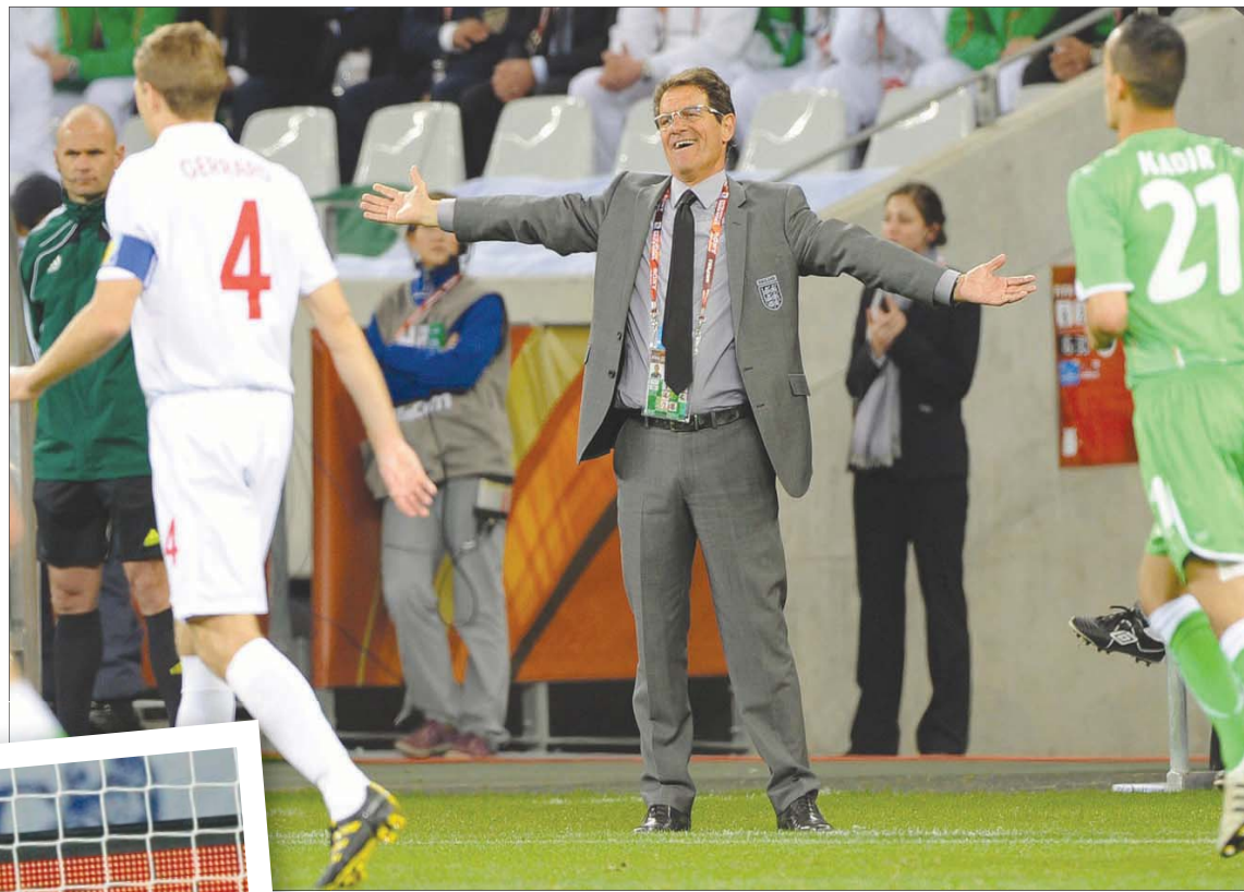
كابيلو يبدو منغلغلاً خلال لقاء إنجلترا والجزائر الذي انتهى بتعادل سلبي

العمل الجاد فقط، ولم تكن نلتفت إلى أي شيء آخر، نظراً لأننا كنا نعرف جيداً أن إنجلترا باكملها تنتظر ما نقوم به. وبعد 4 سنوات، إن هذا الأمر يسبب مشكلة كبيرة للاعبين، لأنه في كل مرة نقام فيها نهائيات كأس العالم أو كأس الأمم الأوروبية يعتقد اللاعبون أنه يمكنهم