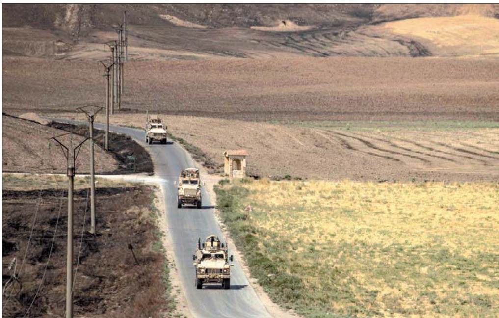
دورية أميركية قرب منشأة نفط شمال شرقي سوريا أمس

سيارة قال بأن أكثر من نصف السيارات توقف عن العمل لعدم توفر البنزين وارتفاع سعره في السوق السوداء. وبينما تراجعت حركة السير في شوارع العاصمة والمدن السورية ارتفعت أجور النقل بشكل عشوائي. وقالت سيدة دمشقية بأن سائقي التاكسي «يرفعون الأجرة بحسب زمن انتظارهم على دور البنزين كلما زادت الساعات ارتفع الأجر». ويرى اقتصاديون في دمشق أن العقوبات الاقتصادية وقانون قنصر عمق أزمة المحروقات في سوريا، إذ تحول دون استيراد المشتقات النفطية بشكل مباشر، كما قيدت العقوبات حركة التهريب التي كانت تتم عبر إيران وروسيا، وزادت الأمور سوءا بعد انفجار ميناء بيروت. هذا بالإضافة إلى تراجع التعاملات مع قوات سوريا الديمقراطية التي تسيطر على مناطق إنتاج النفط شرق الفرات بضغط من الولايات المتحدة الأميركية. ويشير إلى أن إنتاج النفط في سوريا، بلغ 406 آلاف برميل في عام 2008. وانخفض إلى 24 ألف برميل في عام 2018. حسب موقع «بريتش بتروليوم».