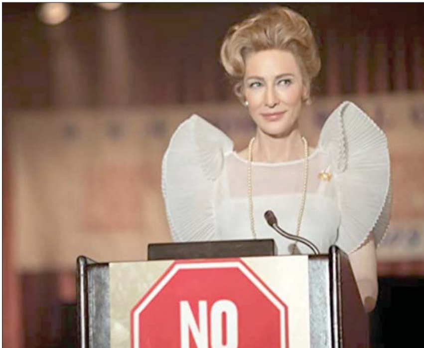
كيت بلانشيت مرشحة عن دورها في «مسز أميركا»