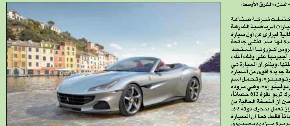
سيارة فيراري «بورتوفينو»

هجين تنتجها الشركة الإيطالية. تعتبر السيارة «بورتوفينو إم» هي السابعة في خطة الشركة التي تستهدف طرح 15 طرازاً جديداً خلال الفترة من 2018 إلى 2022.