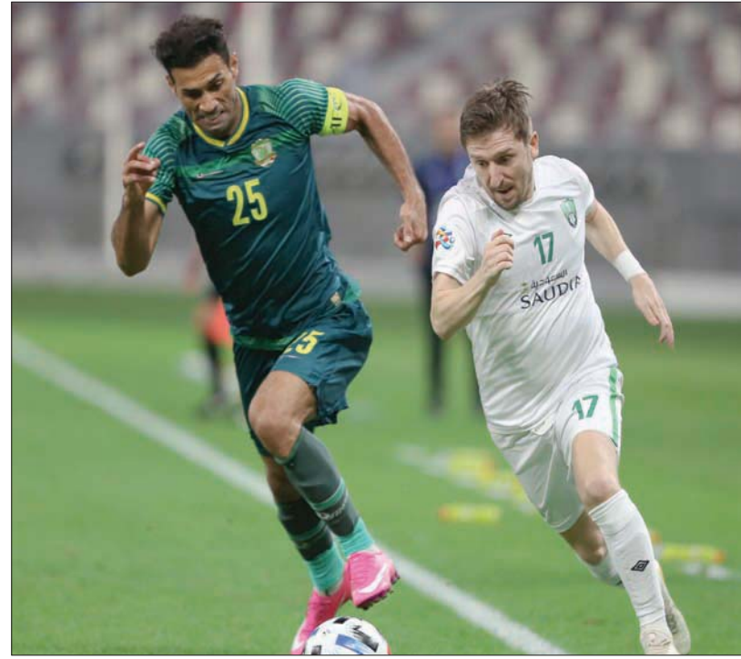
الأهلي تعرض للخسارة أمس على يد «الشرطة» العراقي (الشرق الأوسط)