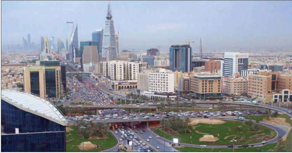
الرياض تسجل قفزة في مؤشر المدن الذكية في العالم (الشرق الأوسط)

ويرتكز المؤشر على كيفية إدراك السكان لنطاق وتأثير الجهود المبذولة لجعل مدنهم «ذكية»، وتحقيق التوازن بين الجوانب الاقتصادية والتكنولوجية مع الأخذ بعين الاعتبار «الأبعاد الإنسانية»، ويسعى التقرير إلى أن يكون مرجعاً وأداة للعمل على بناء مدن شاملة، ذكية، وديناميكية، إلى المساهمة في سدّ الفجوة بين تطلعات واحتياجات السكان، والتوجهات السياسية في