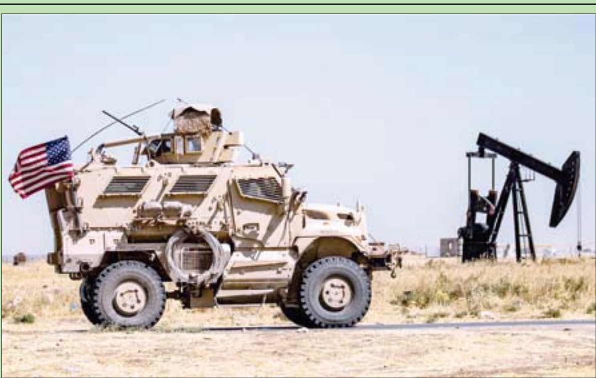
رام الله، كنان زيون

عربية عسكرية أميركية تحرس حقل نفط الرميلان في الحسكة شمال شرقي سوريا أمس