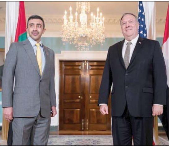
بومبيو وعبد الله بن زايد في واشنطن

قائمة على ثوابت متينة، ووزارة المالية حريصة بدورها على تعزيز هذه العلاقة من خلال مواصلة الحوار والتنسيق المشترك لخلق مجالات تعاون جديدة تساهم في تعزيز النمو الاقتصادي بين البلدين».