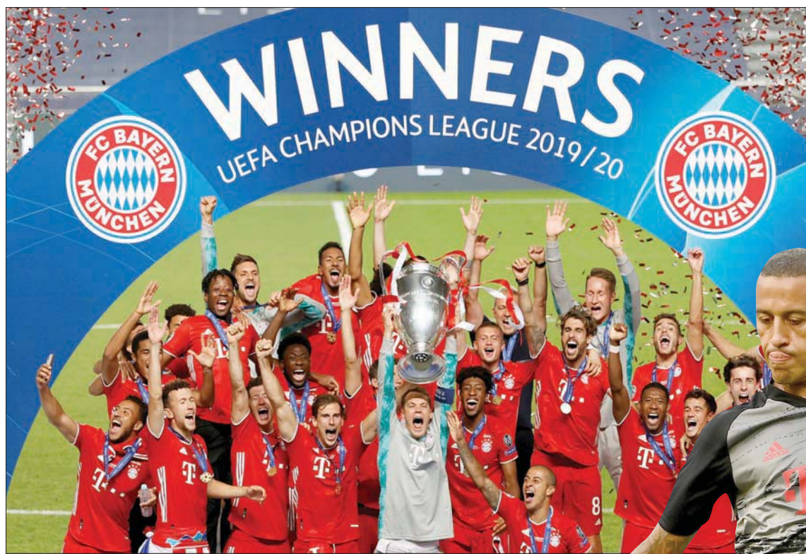
بايرن ميونخ بطل أوروبا وحامل الثلاثية التاريخية يتطلع لاستمرار هيمنته في الموسم الجديد

أقبل مدبراه الإيطالي كارلو أنشيلوتي (2017) والكرواتي نيكو كوفاتش (2019) في وقت مبكر من الموسم، أو تخلفه بفارق تسع نقاط عن دورتموند في 2018، عوض في نهاية كل موسم في طريقه لنيل درع البوندسليغا.