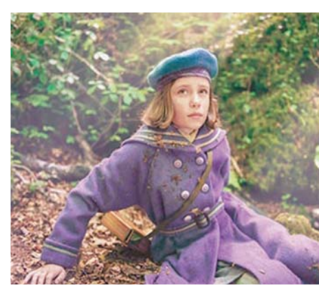
لقطة من «الحديقة السرية»

الأفلام المتجهة للتلفزيون 28 فيلماً أي بزيادة سبعة أفلام عن العام الماضي.