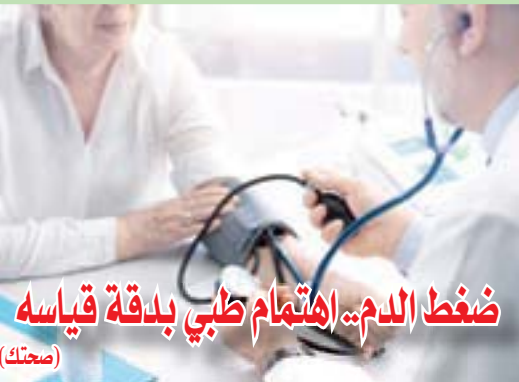
ضغط الدم: اهتمام طبي بدقة قياسه (صحتك)