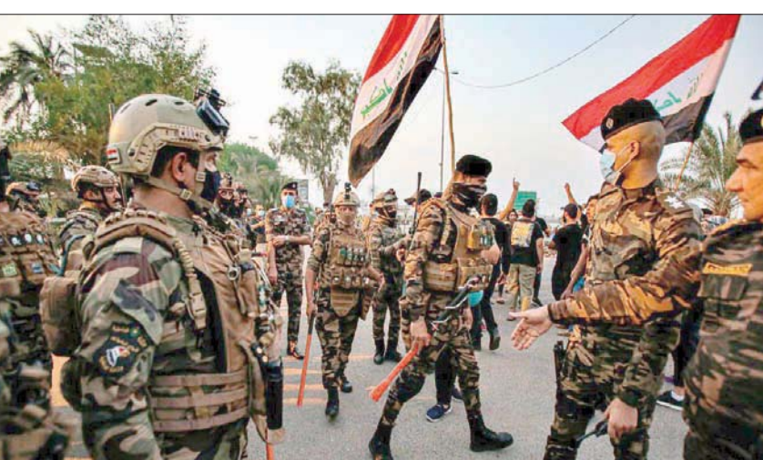
قوات عراقية تمنع متظاهرين من اقتحام مبنى المحافظة خلال احتجاجات في البصرة

وأضاف محيي الدين، أن «داعش» عاد منذ نحو سنتين من مرحلة النطاق الأنفاس إلى إعادة الهيكلة وإعادة الظهور». وأوضح، أن «مسألة بقاء القوات الأميركية من دعمها في العراق أتوقع بقاء القوات الأميركية في المنطقة رغم أن ترمب يحاول عبر الحملة الانتخابية أن يعطي انطباعاً بأن الجنود الأميركيين سوف ينسحبون، وقد ذكر الأعداء التي هي بحدود ألفي جندي»، مؤكداً أن «القواعد الأميركية باقية، وهناك قواعد تم تحصينها لفترات طويلة من الزمن وليست مرحلية؛ لأن ذلك جزء من الاستراتيجية الأميركية حيال المنطقة».