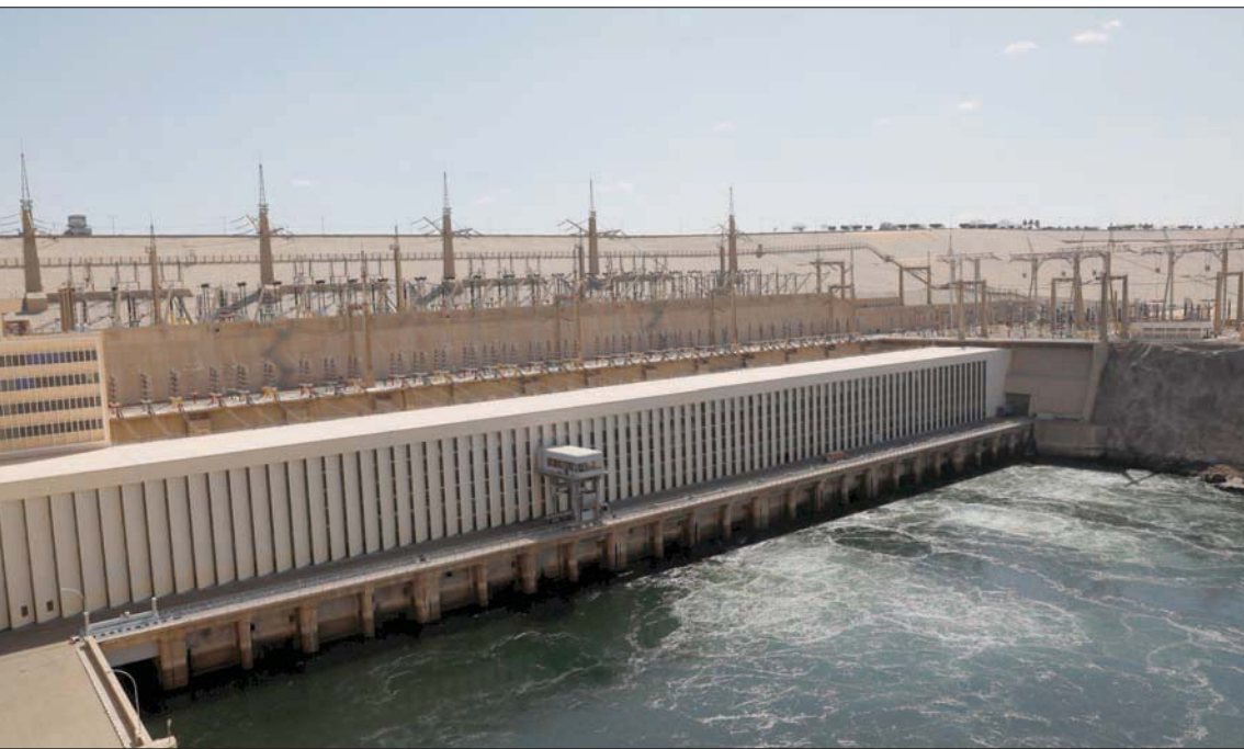
منظر عام لسد أسوان

في وقت تستعد مصر لمواجهة الفيضان والسيول، تترقب القاهرة استئناف مفاوضات النهضة، الذي تبنه إثيوبيا على «الذيل الأزرق»، ويثير توترات مع دولتي مصب نهر النيل (مصر والسودان)، وأكد الدكتور مصطفى مدبولي، رئيس مجلس الوزراء المصري، أمس، أن «الحكومة اتخذت الإجراءات اللازمة استعداداً لمواجهة السيول التي يمكن أن تتعرض لها البلاد خلال الفترة المقبلة»، مشدداً على أنه «تم التأكيد على جميع المحافظين برفع درجة الاستعداد وتم إرسال خطابات لجميع المحافظين لالتهام من الاستعدادات التي تجري في هذا الشأن»، مؤكداً أن «الأجهزة المعنية تواصل حالياً جهود تطهير مخزات ومناشآت الحماية من السيول التي تم تنفيذها»، فيما أعلنت «الري المصرية» أمس «حالة الاستنفار العام لاستقبال فيضان نهر النيل، حيث بدأت مناسيب المياه في الارتفاع مع وصول مياه الفيضان من الهضبة الاستوائية وهضبة الحبشة»، واجتمع الدكتور محمد عبد العاطي، وزير الموارد المائية والري في مصر، أمس، لمراجعة موقفاً الإجراءات والاستعدادات الحالية لمواجهة السيول مياه الفيضانات، التي تتصدر عبر الهضبة الإثيوبية والأراضي السودانية، إلى نهر النيل. وقال وزير الري المصري في تصريحات سابقة، إن اللجنة العليا المتابعة إيراد النهر «في حالة انعقاد