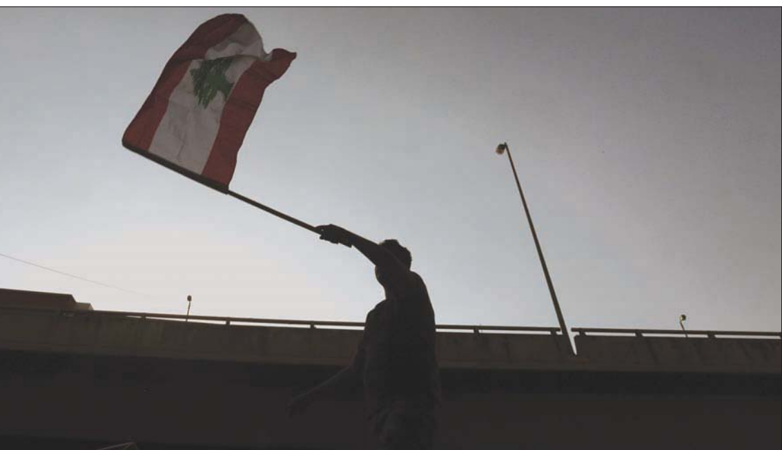
تتعاطف المخاوف في لبنان من تفاقم موجتي التضخم وانفجار النقد وسط الأزمة الاقتصادية الحادة

بانهم كانوا يحاولون تهريب أموالهم، هذا في وقت اختاروا فيه ألا يستفيدوا من الفوائد المرتفعة التي كانت تدفعها المصارف للمودعين في هذه الفترة». كما أبدت المصارف خشيتها من «ردة فعل المصارف المراسلة الخارج من القرينة التي يضعها القرار لجهة اعتباره أن التحويلات المصرفية التي تمت تخفي عمليات تبيض (غسل) أموال، وأن ما تم استعادته منها يندرج في هذا الإطار». كذلك أن «يقوم العملاء غير المقيمين بتقديم دعاوى في الخارج ضد المصارف أو غيرها بحجة (مبرة) (لا) أنهم يتعرضون إلى التهديد لإجبارهم على تحويل مبلغ إلى لبنان».