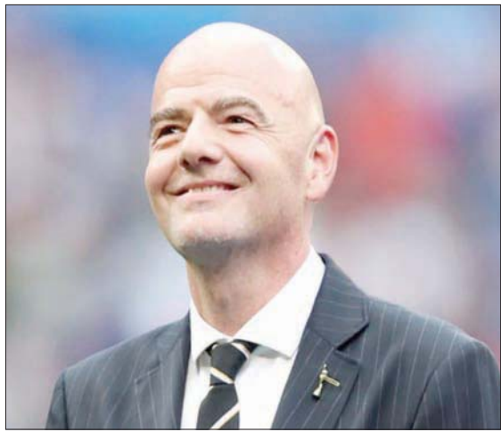
إنفانتينو

للموسم الرياضي». وأضاف: «جاء هذا الإنجاز لترجمته على أرض الواقع الجهود المخلصة لنادي الهلال (إدارة وأجهزة فنية وللاعبين)، امتداد الموسم الكروي السعودي، كما جسّد هذا الإنجاز روح الاخلاص والتفاني التي ميزت أداء الفريق وصولاً إلى الحصول على اللقب الكبير». وأردف: «أرجو منكم نقل فائق التهاني إلى أسرة نادي الهلال على هذا الإنجاز الذي يعزز مكانة النادي المتميزة على الساحة الكروية السعودية والقارية؛ متمنين لكم دوام التفويق والسداد في خدمة منظومة اللعبة في السعودية».