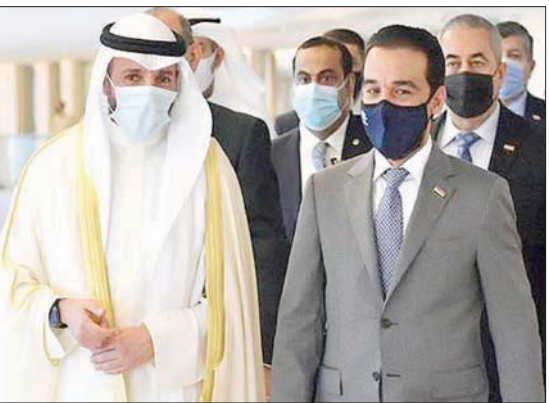
الغانم خلال لقائه الحلبيوسي في الكويت أمس

وسبل تعزيزها وتطويرها في المجالات كافة. كما تم خلال المباحثات تبادل وجهات النظر إزاء العديد من الملفات والقضايا ذات الاهتمام المشترك، إضافة إلى ما تشهده دول العالم من مستجدات. كما أجرى وزير الخارجية ووزير الدفاع الكويتي بالإنيابة الشيخ أحمد ناصر المحمد الصباح مباحثات مع الحلبيوسي في وزارة الخارجية الكويتية أمس الخميس.