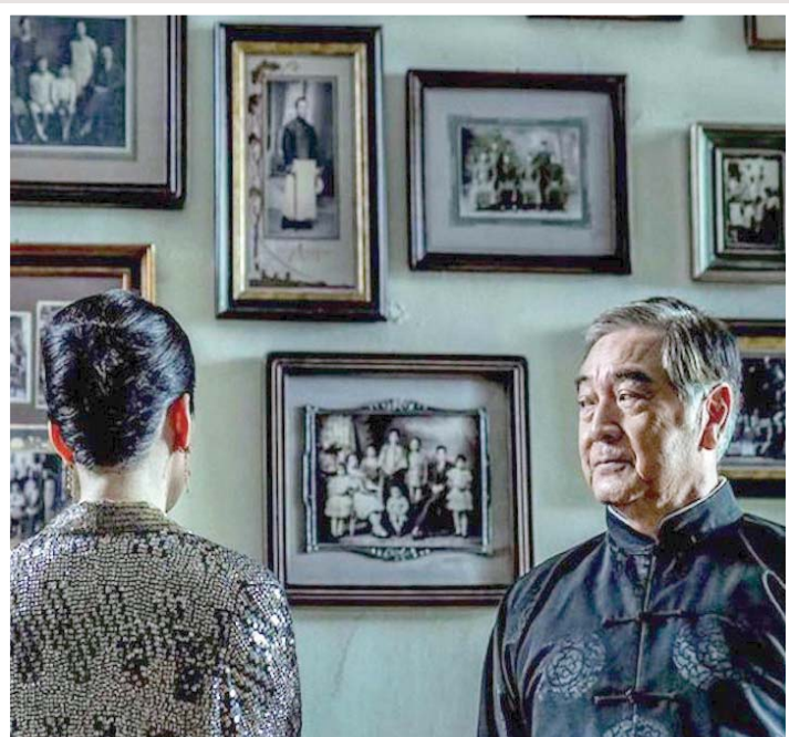
مشهد من «حب وراء حب»

● فانتازيا عن رواية نشرت سنة 1911 حول فتاة يتيمية في العاشرة من عمرها احتضنها عفتها الطيب الذي يعيش في قصره البعيد. خلال تجوالها في حديقة المكان تعثر على باب موصد يؤدي إلى حديقة أخرى سرية.