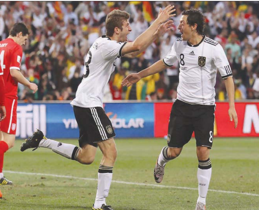
أفراح الألمان وأحران إنجلترا في مونديال 2010

الوحيد وراء تراجع مستوى المنتخب الإنجليزي في البطولات الكبرى. لكن كابيلو يعتقد أن الأمر يختلف مع المدير الفني الحالي للمنتخب الإنجليزي، غاريت ساوثغيت، ويقول: «كانت تشكيلة الفريق، الذي أشرف على قيادته، كبيرة في السن، ولم يكن لدينا كثير من اللاعبين الشباب، لذلك كان الفريق يعاني من الإرهاق. أما الآن