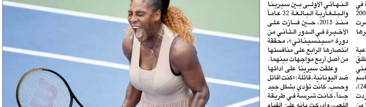
سيرينا تصرخ احتفالاً بفوزها على ساكاري

وكان الفوز على ساكاري 105 لسيرينا في «فلاشينغ ميدوز»، معززة رقمها القياسي بعدد الانتصارات في البطولة الأمريكية الذي انتزعه بعد الدور الأول من مواطنها كريستن إيفرت (101 مباراة). وبعد المفاجأة المدوية التي حققتها