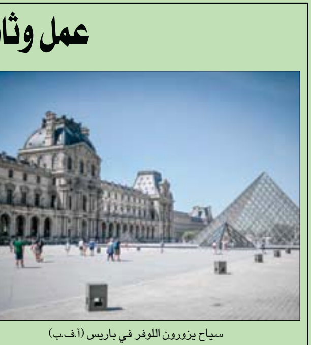
سياح يزورون اللوفر في باريس (أ.ب.)

باريس - لندن، «التشرق الأوسط» في أكثر من 60 بلداً، معرض قريباً عمل وثائقي للفنان الإيطالي ليوناردو دا فينيتشي يتحور حول المعرض الناجح الذي شهده متحف اللوفر في باريس نهاية السنة الماضية. يذكر أن هذا العمل البالغ مدته 90 دقيقة بعنوان «ليلة في اللوفر: ليوناردو دا فينيتشي»، ينقل المشاهد في رحلة إلى قلب النحت الفني والسير الذاتية للمعلم الكبير من عصر النهضة، عبر القاعات المختلفة لأكثر متحف في العالم، كما ترافق مشاهد الوثائقي مقطوعات موسيقية لبعض