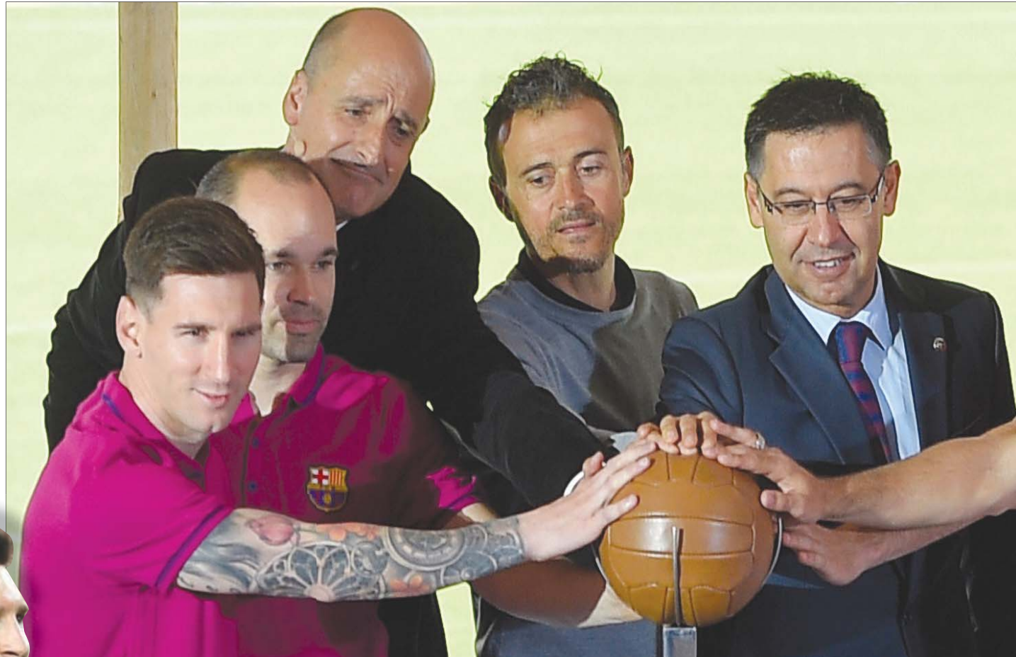
انسجام قبل أن تهب العاصفة... ميسي وبارتوميو وآخرون في النادي الكاتالوني

بدوري أبطال أوروبا، من بين القاب أخرى. واستعانت إدارة النادي بالمدرّب الهولندي رونالد كومان لإحداث ثورة في الفريق بعد الانهيار الذي عانى منه تحت قيادة مديره المقال كيكي سبتين، الذي أخفق برشلونة تحت قيادته في الاحتفاظ بلقب الدوري الإسباني، الذي توج به الغريم التقليدي ريال مدريد. وسيشكل ميسي الآن جزءاً من عملية إعادة بناء الفريق حتى لو بلغ سن 33 عاماً في نهاية مسيرته مع برشلونة، وربما يقنعه رئيس جديد بالبقاء مع إجراء انتخابات رئاسة النادي المقرر إجراؤها في مارس (آذار) القادم، ولكن اعتباراً من يناير (كانون الثاني) القادم، يتمتع ميسي بحرية التفاوض على الانتقال إلى أي نادٍ آخر، مع انتهاء عقده في يونيو (حزيران) 2021.