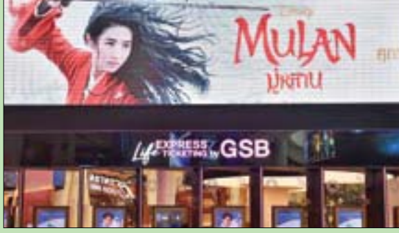
فيلم «مولان» الذي بدأ عرضه على محطة ديزني للبث التدفقي وفي دور السينما العالمية يواجه موجة من الانتقادات ودعوات للمقاطعة (أ.ف.ب)

لمنتجة «ديزني بلس» لبث الأفلام والمسلسلات، يوم الجمعة الماضي. كان كثير من الأنظار قد تركزت على الصين بسبب أسلوب تعاملها مع الإقليم المسلمة في سنغان، حيث احتجزت السلطات ما يقارب مليون شخص على الأقل داخل معسكرات احتجاز خارج نطاق القضاء، في الوقت الذي أفادت تقارير بأن نساء الأويغور جرى فرض تعقيم إجباري وتنظيم للأسرة عليهن في إطار حملة حكومية للحد من معدلات المواليد، بينهن، الأمر الذي وصفه خبراء بأنه «إبادة جماعية ديوموغرافية».