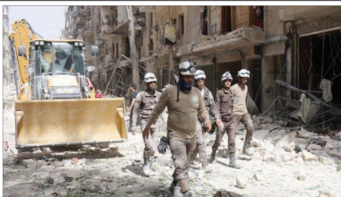
صورة أرشيفية لعناصر «الدفاع المدني» وسط الدمار في حلب