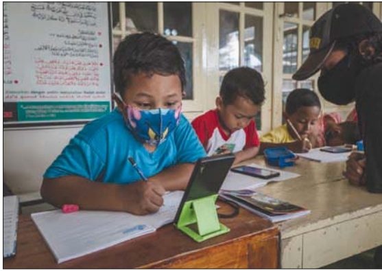
مع إغلاق المدارس أصبح الهواتف المحمولة أساسياً للتعليم

في بث البرامج التعليمية لمختلف المستويات الدراسية لعدة ساعات معينة في اليوم في كل يوم. غير أن أغلب الطلاب في البلاد يواصلون الدراسة عبر الإنترنت باستخدام الهواتف المحمولة، ويشترون حتى واحد فقط بتقاسم بعض العائلات التي لا تملك سوى هاتف محمول واحد فقط بتقاسم العمل عليه مختلف أبناء العائلة، والذين يظنون إلى الانتظار في أغلب الأحيان حتى عودة الوالدين إلى المنزل حتى يتمكنوا من تنزيل فروضهم المدرسية باستخدام الهاتف، وبعد أسلوب التدريس عبر الإنترنت من الأمور الجديدة تماماً بالنسبة إلى العديد من المعلمين في إندونيسيا، لا سيما في المناطق الريفية والنائية. وغالباً ما يعاني الطلاب من الارتباك بسبب الدروس، ويمكن لأولياء الأمور - الذين ربما لم يستكملوا بأنفسهم مستوى التعليم الابتدائي لا غير - ألا يكونوا على استعداد لتوفير ميزة الدروس الخصوصية لأبنائهم في المنزل.