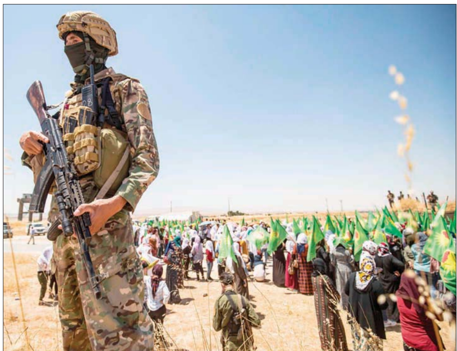
عناصر من «قوات سوريا الديمقراطية»، وسط حشود كردية

رفع السواتر ضمن مناطق وجوده في كل من قرى قميناس والشرب وتفتخان والطرف الغربي من مدينة سراقب في شرق إدلب. ودوى انفجار قرب إحدى النقاط التركية في منطقة عين الحمرا، نتيجة تفجير الجيش التركي عبوة لاصقة مزروعة بصاروخ تالف على طريق حلب - اللاذقية الدولي (إم 4). وفي الوقت ذاته، وزعت القوات التركية منشوراً على أهالي مدينة أريحا، في ريف إدلب الجنوبي، أمس، طمأنتهم فيه إلى أن تركيا تعمل على الحفاظ على أرواح وممتلكات أهالي إدلب، وتبذل جهوداً على جميع المستويات لضمان الاستقرار الدائم، ووفق تدفق دماء الأبرياء والحفاظ على سلامتهم في المنطقة، ومنع أي اجتياح أو عمل عسكري على النظام والمليشيات الإيرانية المتمركزة في مدينة كفرنبيل وبلدة حزارين المجاورة صعدت قصفها المدفعي والصاروخي على بلدات سوفهن وكفرعوي ودير سنبل والمبارة جنوب إدلب، ما أسفر عن إصابة 5 مدنيين، بينهم امرأة، بجروح خطيرة، نقلوا على إثرها إلى المشافي الحدودية شمال سوريا»، لافتاً إلى أن عدد الذخائر الصاروخية والمدفعية التي طالت مناطق المعارضة جنوب إدلب بلغ نحو 150 قذيفة منذ ساعات، لافتاً إلى أن حالة خوف وقلق طالت المدنيين الموصلة قوات النظام تصعيدها، في الوقت الذي بدأ