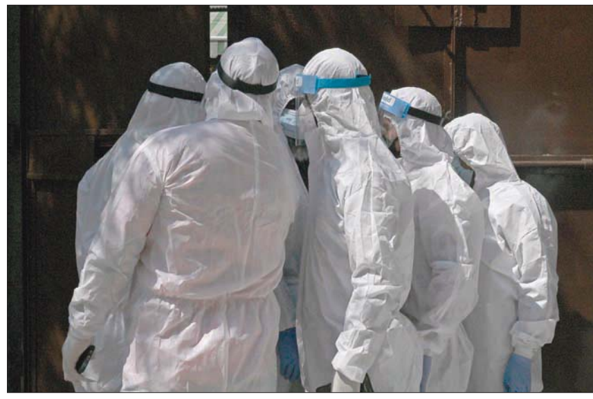
عاملون صحيون أمام مدرسة في تشيمير الهندية لإجراء فحوصات كورونا

سياحي في الهند، فتح أبوابه أمام الزوار في 21 سبتمبر (أيلول) مع اعتماد تدابير صحية جديدة، بعد إغلاق لأكثر من ستة أشهر بسبب أزمة كوفيد - 19، على ما أعلنت السلطات أمس (الثلاثاء) رغم التفشي المتسارع للوباء في البلاد.