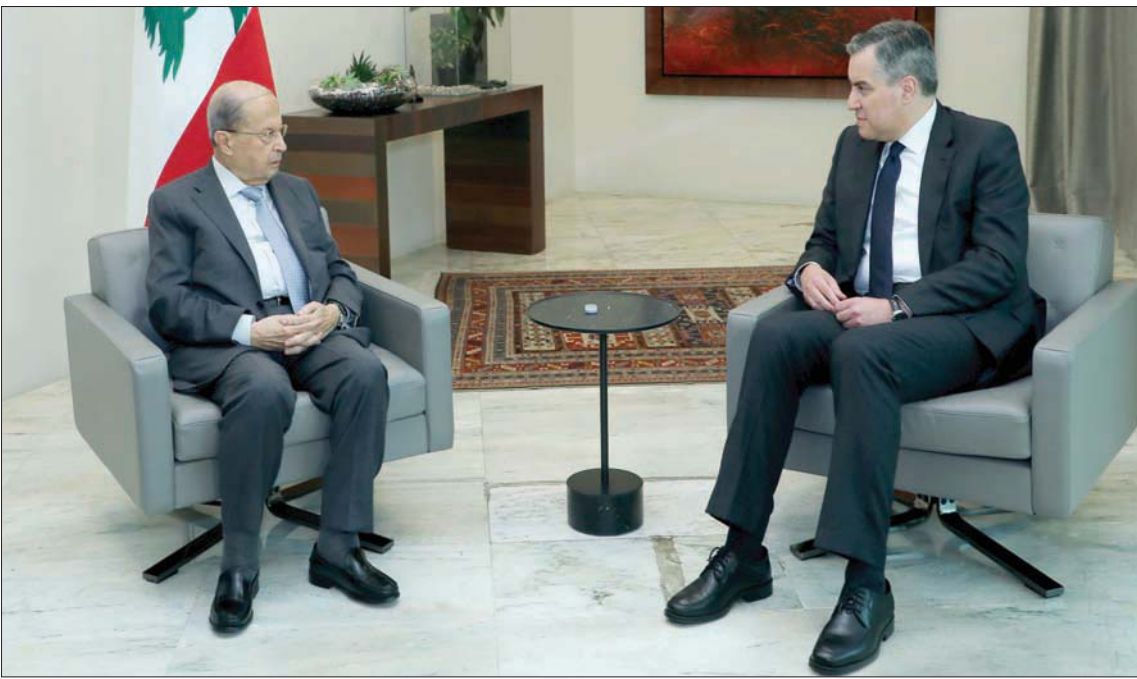
الرئيس ميشال عون خلال استقباله أمس رئيس الحكومة المكلف مصطفى أديب

الواردة من مكتب الدولة لحماية الدستور (المخابرات الداخلية)، فإن العملية المعنية تمت معالجتها من قبل السلطات الفيدرالية المسؤولة. كما أن مكتب لديه نتائج أخرى أو نتائج خاصة به».