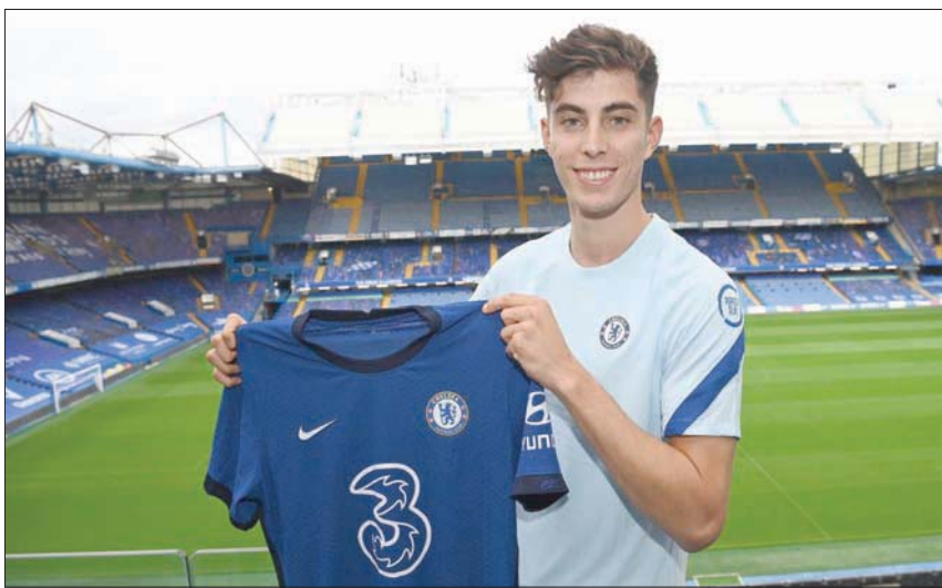
الألماني هافرتس أحدث صفقات تشيلسي

بأكثر من 100 مليون جنيه إسترليني، يتطلع تشيلسي للمنافسة على اللقب الإنجليزي في موسم 2020-21. ويوضح جدول ترتيب الدوري في الموسم الماضي التحديات الكبيرة أمام تشيلسي، إذ أنهى المسابقة بفارق 33 نقطة عن ليفربول البطل و15 نقطة عن مانشستر سيتي صاحب المركز الثاني.