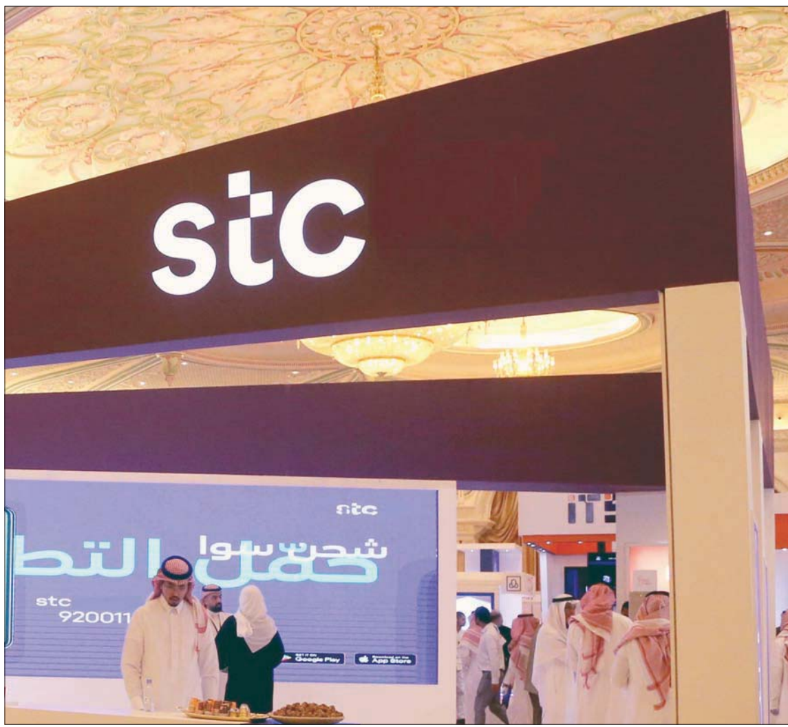
شركة الاتصالات السعودية تتعاون مع الفوايفون حول شراء حصة فودافون مصر (الشرق الأوسط)

شركة «فودافون مصر»، موضحة أن الطرفين اتفقا على تقييم نقدي قدره 8,9 مليار ريال (2,392 مليون دولار) لحصة 55 في المائة في «فودافون مصر». أي ما يعادل 4,3 مليار دولار كامل على تمديد مذكرة التفاهم لمدة 60 يوماً ابتداءً من تاريخ اليوم. وأوضحت مجموعة «إس تي سي» السعودية أواخر يناير الماضي أنها أبرمت مذكرة تفاهم مع مجموعة فودافون بخصوص استحواذ محتمل لحصة في