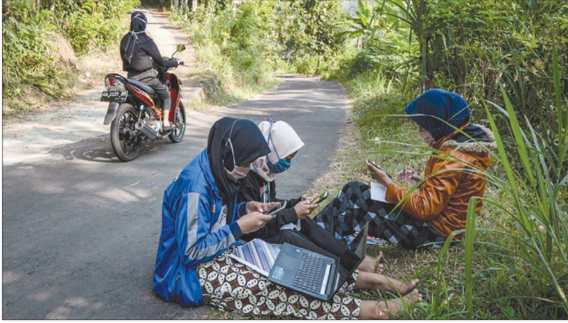
طالبات يجلسن على الطريق لاستكمال فروضهن المدرسية باستخدام الهواتف الذكية والحاسوب المحمول

تواصل الطالبات الثلاث استذكار دروسهن على رأس الطريق - من المناطق النائية التي تعمل فيها شركة «تلكوم سيل» للاتصالات على توفير خدمات شبكة الإنترنت، فضلاً عن قرية «بياه باسونغ سانغ»، التي يتسلف فيها ما لا يقل عن 20 طالباً رؤوس الأشجار في كل يوم من أجل الدراسة. بيد أن هذه الجهود لن تستكمل حتى حلول عام 2022 بحسب تصريحات السيد سيتياننو هانتورو.