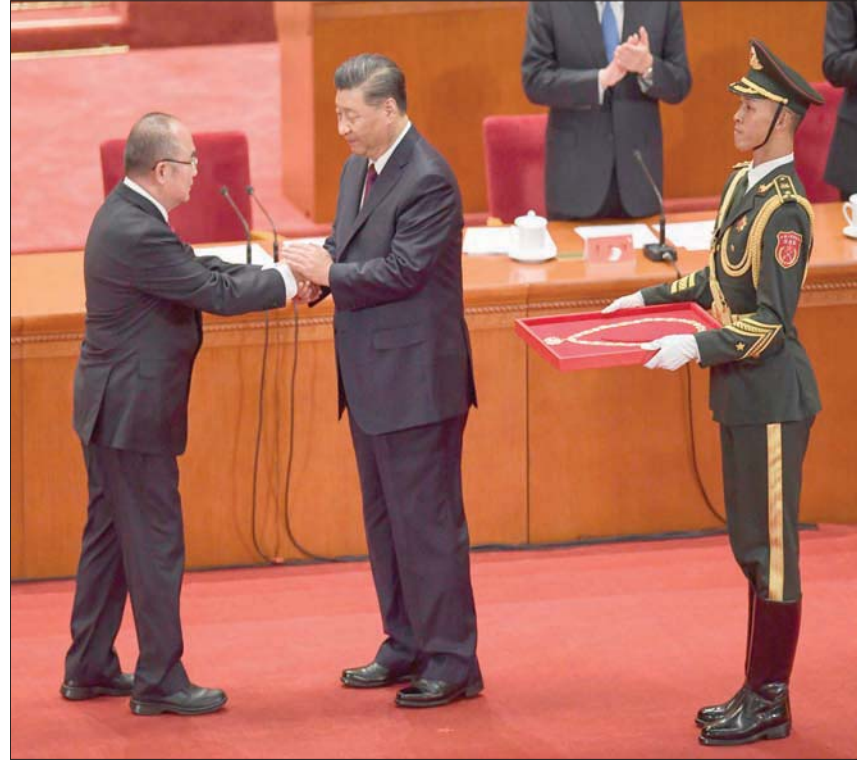
الرئيس الصيني يسلم مدير مستشفى ووهان جائزة أمس