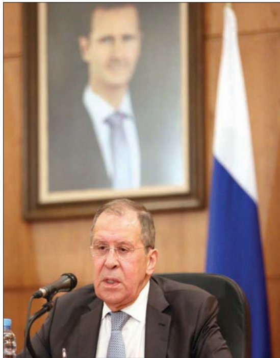
وزير الخارجية الروسي سيرغي لافروف خلال مؤتمر صحفي في دمشق أول من أمس

أهمية خاصة وقديمة شعبية ولا يمكن سلفه (صوغه بسرعة) أو إنجازها بالخط... هذا يجب أن يُنجز بما يحقق طموحات الشعب السوري». كما أنه أغلق الباب أمام احتمال «تعديل» الدستور الحالي لفتح الطريق أمام انتخابات بشروط جديدة، لأن أي تعديل يتضمن الية دستورية معقدة، أضيف إليها شرط الاستفتاء العام، إذ قال المعلم: «الدستور القديم هو شأن ما يتوصل إليه أعضاء اللجنة الدستورية، إن كانوا يريدون تعجيل الدستور وليس من صلاحية اللجنة العليا للانتخابات. وأضاف المعلم أنه لا علاقة لموضوع الدستور بالانتخابات الرئاسية، مؤكداً أنها ستجري في موعدها العام القادم.