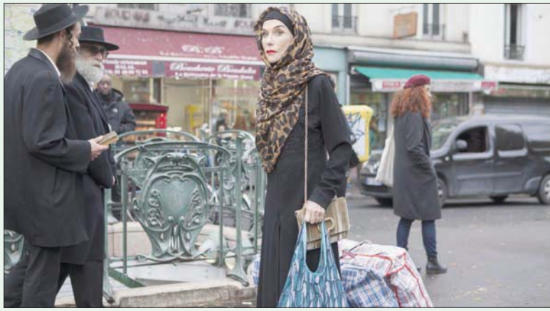
إيزابيل هوبير في دورها الجديد

لتسلم شحنة المخدرات، ويتم لقاء القبض عليهما، بينما تذهب المترجمة لاستئجار على الشحنة التي ظلت مهجورة في الطبيعة، على أمل توزيعها لحسابها الخاص. سيصبح معها مال وثير يسمح بإبداع والدتها داراً جيدة للمسنين.