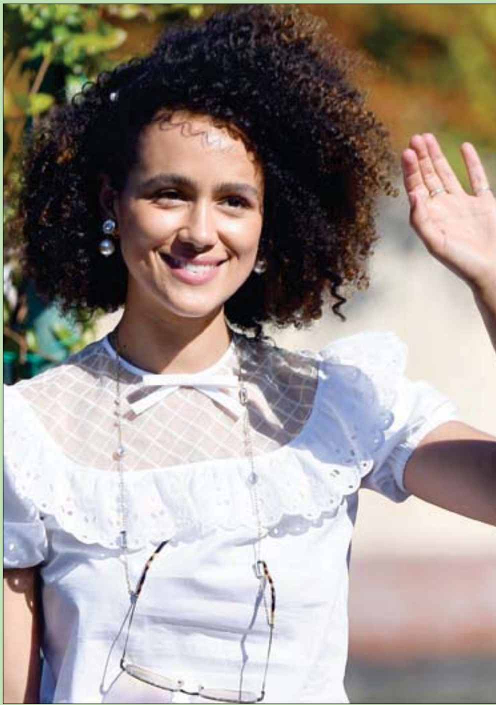
المثلة البريطانية ناتالي إيمانويل تصل إلى مهرجان البندقية السينمائي الدولي أمس

لذلك فالسيد محمود عباس هو من يقع على عاتقه رد السفهاء عن سفهم ضد الإمارات والبحرين والسعودية وبقية دول الخليج.