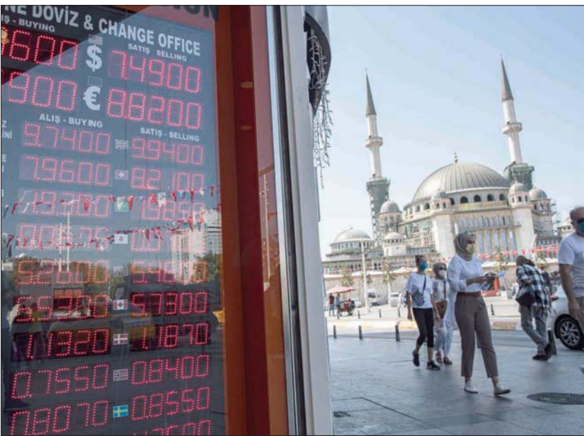
تتهافت العملة التركية في سقوط حر دون أدنى مؤشر على وجود آلية حكومية لإنقاذها (أ.ب.)

في 2011. ورفع البنك توقعه للتضخم بنهاية العام إلى 8,9 في المائة في يوليو (تموز)، مراهنًا على أن التضخم سيبدأ التراجع في وقت مبكر ربما في ذلك الشهر... لكن عدداً قليلاً من المحللين يتوقع حدوث ذلك قريباً، ووجد استطلاع الثقة «رويترز» التضخم بحلول نهاية العام عند 11 في المائة. ومما يزيد من الطين بلة، تراجع أرباح أدوات الاستثمار التركية المحلية، ممثلة بالفوائد على الودائع بالعملية المحلية وأدوات الدين المحلي، والبورصة العاملة في السوق، بالتزامن مع أزمات المحلي، بصدارة أزمة انهيار الليرة في سوق مصرف المحلّة. وهو ما يؤدي إلى هروب المستثمرين من العملة التركية والابتعاد على أدوات الاستثمار الأجنبية، ممثلة بالدولار والذهب المدرة للأرباح.