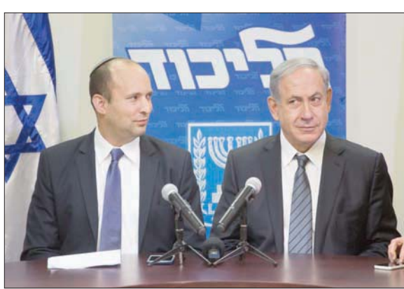
صورة أرشيفية لرئيس الوزراء بنيامين نتنياهو ونفتالي بنيت

الحكومة، يستغلون الوباء لتحقيق غايات سياسية، غير أبهين لما يحصل للجمهور. «هذه فوضى. أظهروا المسؤولية، الفوضى ستؤدي إلى زيادة عدد المرضى في حالة خطيرة. لهذا أقول للدول المعارضة تحمّلوا المسؤولية وأوقفوا هذا السلوك غير اللائق والخطير». وكشف نتنياهو عن أنه وجّه رسالة شخصية إلى أربعة