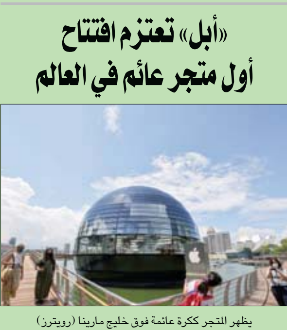
يظهر التجر ككرة عائمة فوق خليج مارينا

سجن «غلاهاوس» العسكري في كولشيستر. وتراوح عقوبات الحراس ما بين 14 إلى 28 يوماً، في عقوبة يُعتقد أنها الأكبر لعدد من الجنود يُسجنون لارتكاب جريمة واحدة في الوقت نفسه. وحضر 16 حارساً المهرجان لحضور مهرجان مع أفراد من الجمهور في حديقة على ضفاف النهر، حسب صحيفة «ميترو» اللندنية. وأثبتت التحاليل تعاطي أربعة من الحراس الكوكايين، وستعرضون للطر من الجيش بعد قضائهم عقوبة الحبس في