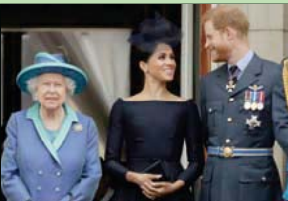
الملكة إليزابيث وهاري وميغان

داخلياً خلال مراحل التحقيق المختلفة». وصرح مصدر من الجيش لموقع «ميل أونلاين»، بأن خرق حالة الإغلاق لم يعرض الملكة أو الأمير فيليب للخطر، لأن الجنود «لم يكن لهم أي اتصال على الإطلاق بالعائلة المالكة أو أفرادها»، مضيفاً: «نحن نخوون بقواتنا المسلحة للدعم الذي قدمته (إدارة الصحة الوطنية) خلال أزمة (كوفيد - 19)، لكننا نطالب بأعلى معايير السلوك من جميع أفرادنا». جدير بالذكر أن «التعامل مع مخالفات أوامر التباعد الاجتماعي من رجال الحرس الويلزي قد جرى في ذلك أسره». وقال مصدر من الجيش لموقع «ميل أونلاين»، بأن خرق حالة الإغلاق لم يعرض الملكة أو الأمير فيليب للخطر، لأن الجنود «لم يكن لهم أي اتصال على الإطلاق بالعائلة المالكة أو أفرادها»، مضيفاً: «نحن نخوون بقواتنا المسلحة للدعم الذي قدمته (إدارة الصحة الوطنية) خلال أزمة (كوفيد - 19)، لكننا نطالب بأعلى معايير السلوك من جميع أفرادنا». جدير بالذكر أن «التعامل مع مخالفات أوامر التباعد الاجتماعي من رجال الحرس الويلزي قد جرى في ذلك أسره». وقال مصدر من الجيش لموقع «ميل أونلاين»، بأن خرق حالة الإغلاق لم يعرض الملكة أو الأمير فيليب للخطر، لأن الجنود «لم يكن لهم أي اتصال على الإطلاق بالعائلة المالكة أو أفرادها»، مضيفاً: «نحن نخوون بقواتنا المسلحة للدعم الذي قدمته (إدارة الصحة الوطنية) خلال أزمة (كوفيد - 19)، لكننا نطالب بأعلى معايير السلوك من جميع أفرادنا». جدير بالذكر أن «التعامل مع مخالفات أوامر التباعد الاجتماعي من رجال الحرس الويلزي قد جرى في ذلك أسره».