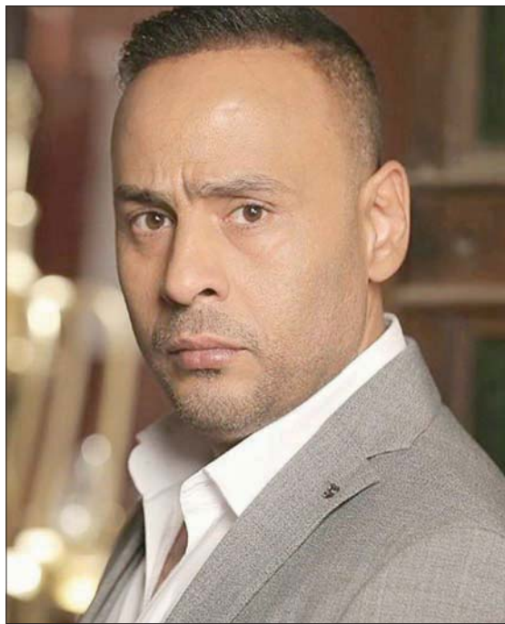
الفنان المصري محمود عبد المغني

وما نوعية الأدوار أو الأعمال التي تتمنى تقديمها مستقبلاً؟ - أتمنى تقديم شخصيات بسيطة ومؤثرة، مثل شخصية المدمن الذي جسدهته في «صاحب المقام». وأتمنى تقديم كل ما هو مؤثر وقريب من قلوب الجمهور، بعيداً عن فكرة «الترند» والانتشار على «السوشيال ميديا»: لأن هذه المواقع ما هي إلا انعكاس لطبيعة تفكير الناس، وإذا لم يحنض الناس الشخصية والعمل ويشعرون بقربها منهم فلن تنجح أبداً. وأنا