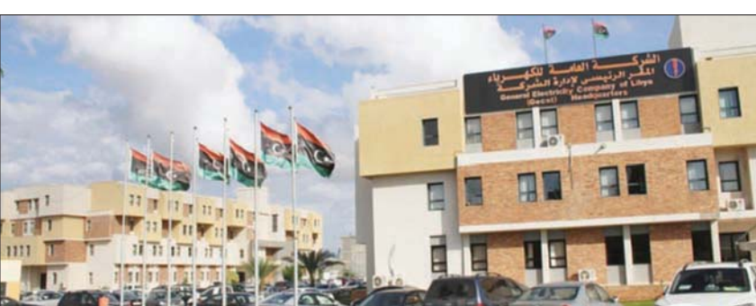
مقر الشركة العامة للكهرباء، في طرابلس

وقال الديوان إن الإدارة السابقة تراخت مع الشركات المتعاقدة معها للصيانة ولم تتخذ إجراءات قانونية حيالها، بالإضافة إلى تأخر الصيانة رغم توفر قطع الغيار، وخروج بعض الوحدات بسبب حرق الفنايات بجوارها. ونقلت وسائل إعلام محلية عن شكوك أن رئيس مجلس إدارة شركة الكهرباء المحال تعهد في حالة موافقة الديوان على قرصه 900 مليون أن تكون حالة الشبكة الكهربائية جيدة جداً، ونوهاً إلى أنه تم تسهيلها ولم تحقق إنجازاً حتى أ في المائة.