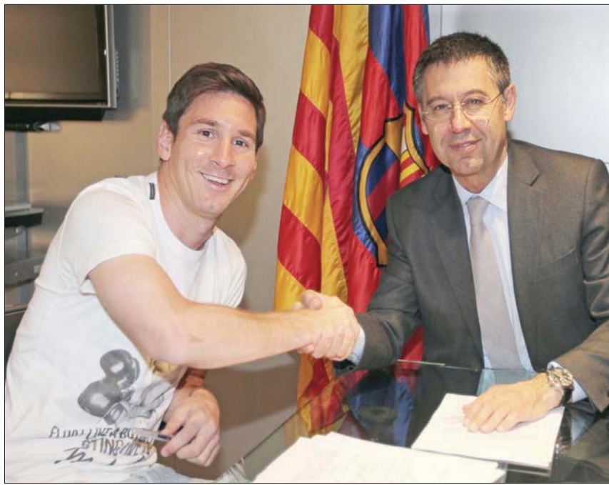
بارتوميو وميسي وعلاقة ليست على مايرام

دون مقابل، لكن النادي الكتالوني لا يعتقد أنه بإمكان ميسي استخدام هذا البند في العقد الذي كان يسمح له بذلك لكن موعد أقصاه العاشر من يونيو (حزيران) الماضي. وعاش ميسي حالة من الغضب خلال الأعوام الأخيرة، في ظل إخفاق النادي في المنافسة على لقب دوري أبطال أوروبا الذي توج به آخر مرة في عام 2015.