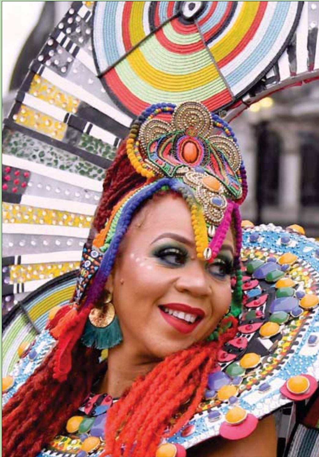
راقصة كاريبية شاركت في الترويج لأول كرنفال «نوتينغ هيل» رقمي في لندن بسبب وباء «كورونا» (رويترز)

صدق الرئيس ترمب، ولكنني لا أستبعد أن ذلك الفأر (رأسمالي) سمين - وبلا لبنتي شاهدت صورته - لكي أبرؤها، فكل قصور الرؤساء في دول العالم الثالث لا يوجد فيها ولا حتى فأر واحد - ولا فخر!!