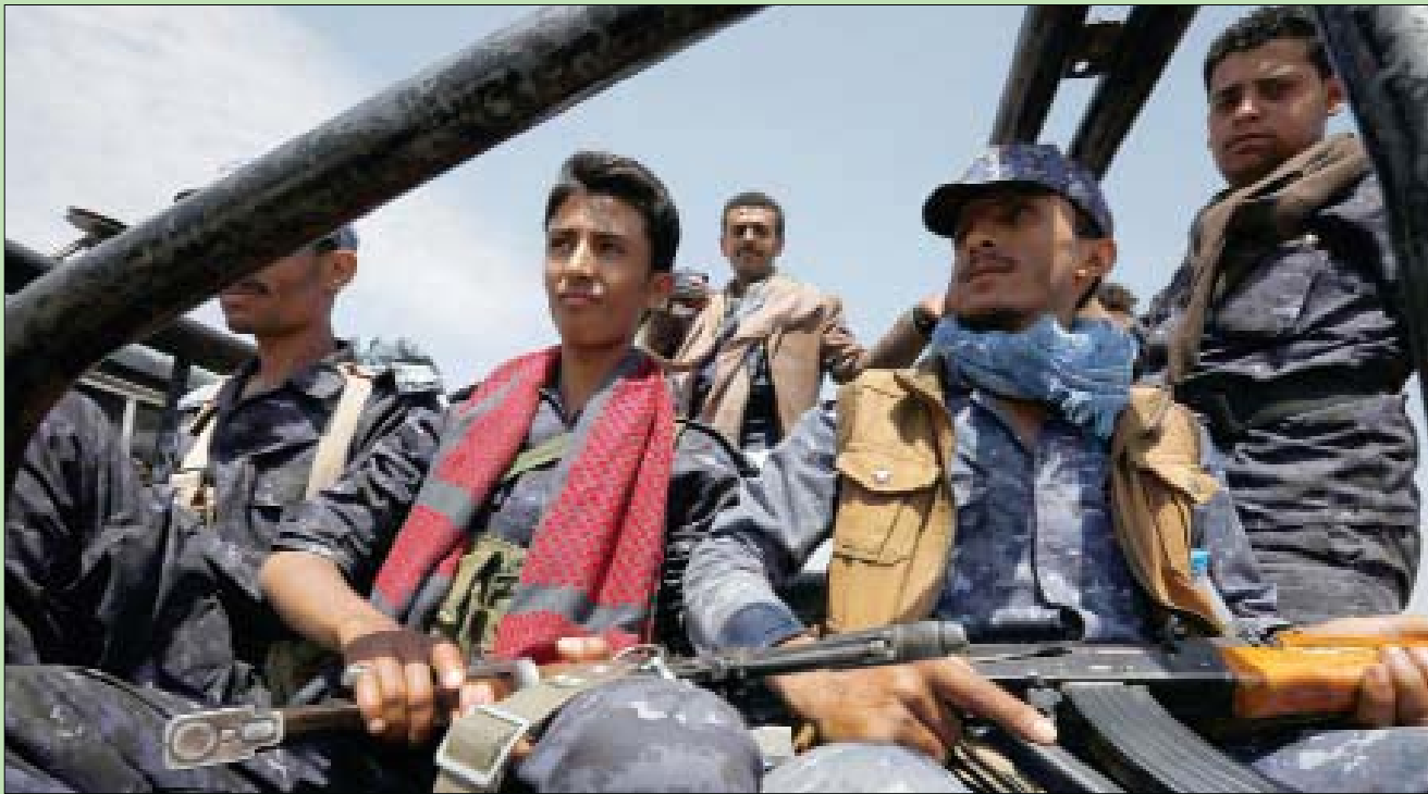
عناصر حوثية خلال تجمع مسلح في صنعاء

في مديرية حُيس بأسلحتها الرشاشة المتوسطة مزارع المواطنين بشكل هستيري، بالتزامن مع استهداف الحارة والمسافرين في الطرقات العامة بالأسلحة القناصة. كما تعرضت منطقة الجاح التابعة لمديرية بيت الفقيه - بحسب المصادر نفسها - لسلسلة من الهجمات الحوثية، حيث أطلقت الميليشيات المتمرس في مناطق سيطرتها النار على التجمعات السكنية بكثافة وعشوائية.