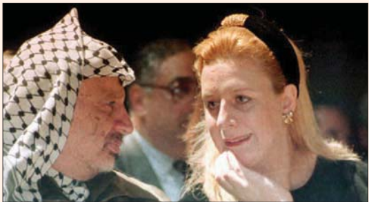
سهى عرفات مع زوجها الرئيس الفلسطيني الراحل في عام 1995

مكتب الرئيس محمود عباس، انتصار أبو عمارة، وأنها هي التي أعطت التعليمات لتقديرها للناس على أساس أنها خاتمة. وتوجهت عرفات إلى الرئيس أبو مازن، تطلب حمايته. وقالت: «أبو مازن يعرف أنني أحميه؛ لكن من حوله يزودونه بمعلومات خاطئة. أنشد أبو مازن أن يوفر لي الحماية قبل أن أتوجه إلى أي زعيم أو رئيس آخر في العالم لحمايتي». وقالت إن هناك من يشوه سمعتها بالقول إنها تحصل على الملايين لكي يظفروا عنها المخصصات الشهرية. وقالت إنها تقبض مخصصات لها ولا يتنحها، هي عبارة عن مرتب تقاعد زوجها، بقيمة 10 آلاف يورو شهرياً». وحذرت من هذه الضغوط قائلته: «هذا إرهاب فكري».