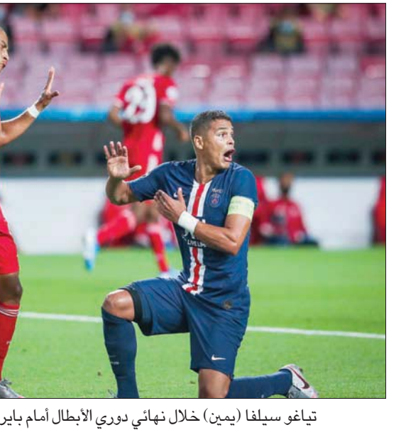
تياغو سيلفا (يمين) خلال نهائي دوري الأبطال أمام بايرن ميونخ

مشاركته في أعلى المستويات منذ عدة سنوات، لا شك لدينا بأن خبرته ونوعيته ستكونان المواهب الموجودة لدينا هنا». وحل تشيلسي رابعاً الموسم الماضي في الدوري الإنجليزي، ليضم المشاركة في دوري أبطال أوروبا. لكن دفاعه أظهر فخراً أحياناً، واهتزت شباهة 45 مرة في 38 مرحلة من الدوري، ليحتل المركز الثاني عشر على هذا الصعيد. كان سان جيرمان يظل فرنسا ووصيف بطل أوروبا، قد شكر عبر رئيسه القطري ناصر الخليفي، سيلفا، على مسيرته الطويلة في النادي: «تياغو، شكراً لثمان سنوات لا ننسى، مليئة بذكريات دائمة، وعلى مشاركتك وتفانك وهالتك». وتابع: «ستكون إلى الأبد أحد أفضل اللاعبين في