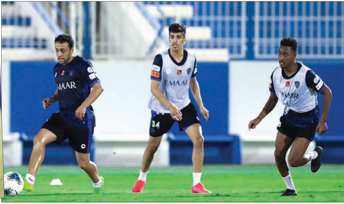
من استعدادات الهلال للموقعة الحاسمة (الشرق الأوسط)

ويحتاج النصر، حامل لقب النسخة الأخيرة من الدوري، إلى تحقيق الفوز في مبارياته الثلاث المقبلة أمام الفيحاء والاتحاد والاتفاق، شريطة تعثر الهلال في الجولات المقبلة وفقدانه سبع نقاط من أجل الحفاظ للنصر على لقبه وتحقق الدوري في مهمة تبدو شبه مستحيلة. وتقام اليوم السبت أربع مباريات في افتتاحية الجولة هي الهلال أمام الحزم في الرياض، والفيحاء ضيفاً على النصر، في حين يستضيف فريق العدالة نظيره الرائد، وفي دوري منطقة عسير يحل أبها ضيفاً على نظيره فريق ضمك في مباراة تقام على