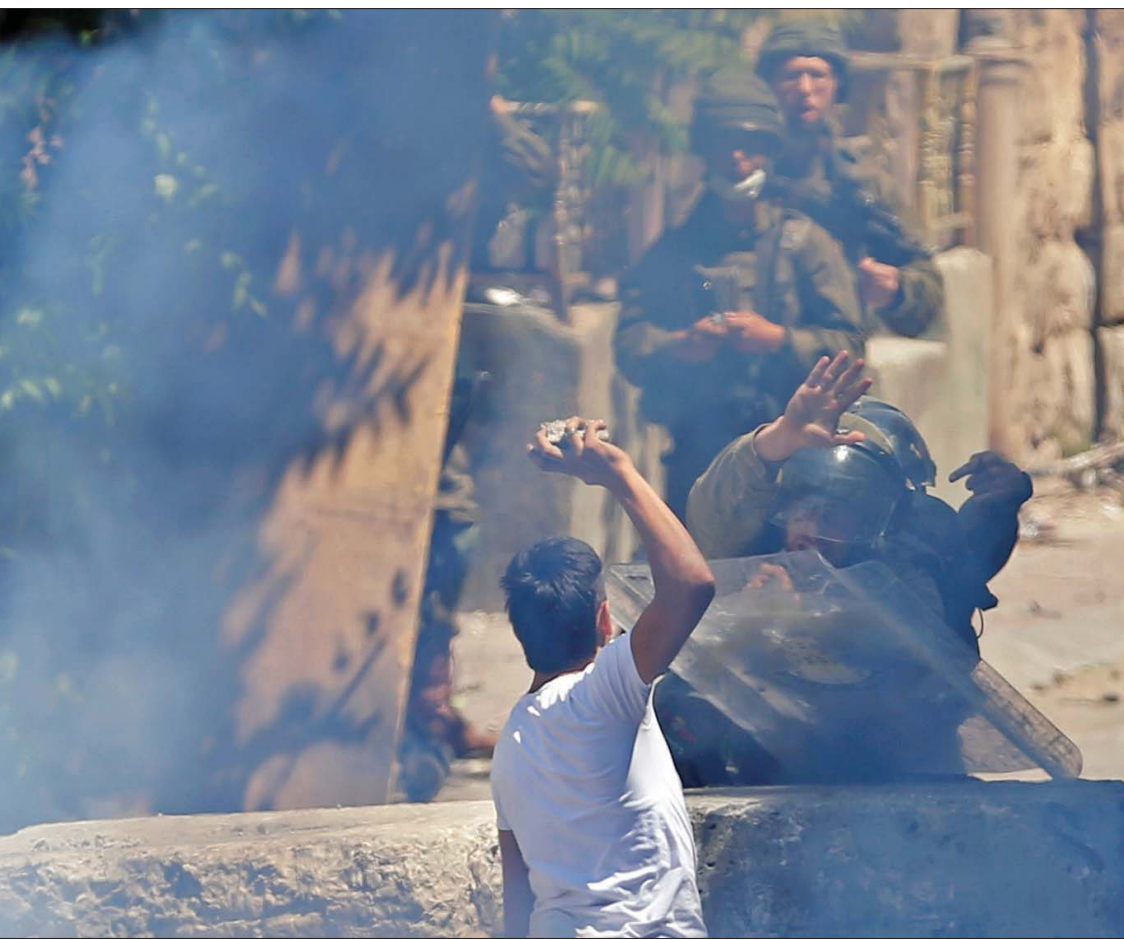
ازدادت حدة الاشتباكات بين المحتجين الفلسطينيين وعناصر الجيش الإسرائيلي في الخليل أمس