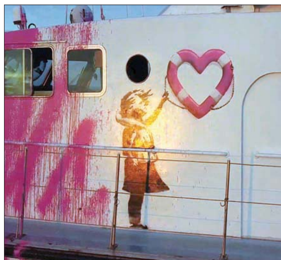
رسم بانكسي على السفينة