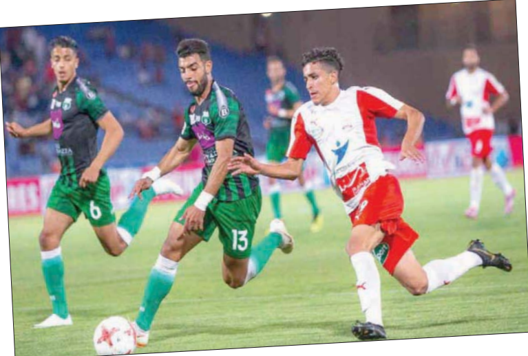
أربع مواجهات جديدة تم تأجيلها في الدوري المغربي بسبب «كورونا»