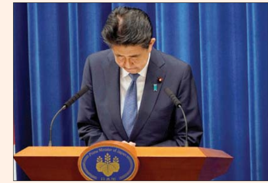
رئيس الوزراء الياباني شينزو أبي في مؤتمر صحفي أعلن فيه تقديم استقالته أمس

بسبب تدهور حالته الصحية، بعد توليه منصبه لنحو ثماني سنوات. وساهم تحفيز قوي نفذه أبي، وتعاونه الوثيق مع البنك المركزي، في تنشيط الأسهم اليابانية، إذ بلغ المؤشر نيكبي أعلى مستوى في 27 عاماً في 2008. وخسر المؤشر نوكيس الأوسع نطاقاً 0,68 في المائة إلى 1604,87 نقطة، فيما ارتفعت قيمة التداولات لأعلى مستوى في أكثر من شهرين عند 2,825 تريليون ين (26,60 مليار دولار). ويدوره، قفز الين من أدنى مستوى في أسبوعين، الجمعة، لتفقد العملة اليابانية أحد أهم مميزات التنافسية، بينما يواجه الدولار صعوبات لإحراز تقدم مقابل عملات أخرى، إذ تضغط أفاق انخفاض أسعار الفائدة الأميركية لفترة طويلة على العملة. ويقول الين الذي كان يتراجع بنحو 0,5 في المائة لأعلى مستوى في الجلسة عند 106,10 للدولار بفضل الأثناء، قبل أن يتراجع قليلاً إلى 106,32. ويُعد الين عملة ملاذ آمن بفضل مكانة اليابان، بصفتها أكبر دائن عالمي. ويقول محللون إنه قفز بفعل أنباء استقالة أبي بسبب أن الضبابية السياسية ربما تحفز الشركات اليابانية