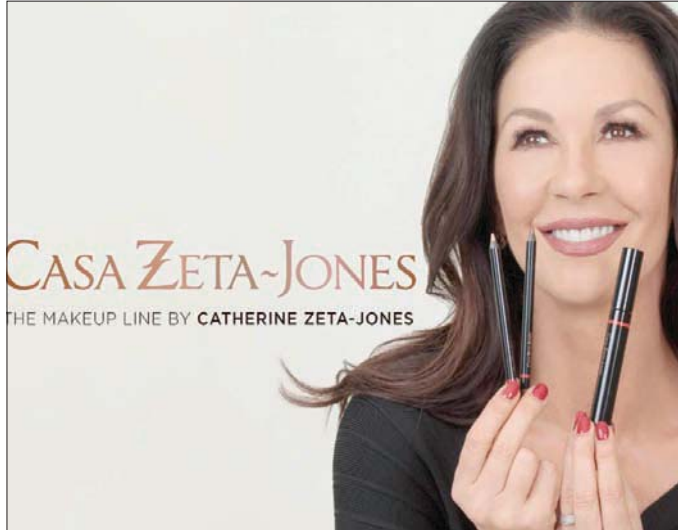
الممثلة كاثرين زيتا جونز اكتفت لحد الآن بقلم كحل وماسكارا