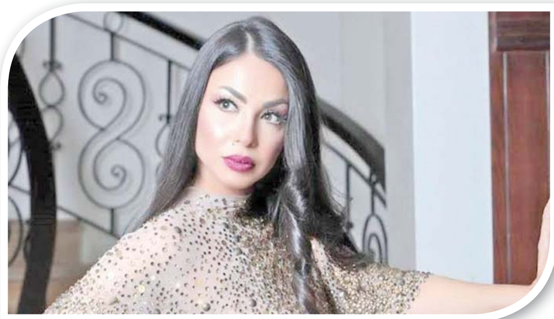
الفنانة اللبنانية دولي شاهين

وترى دولي أن فكرة الانتشار التي تسيطر على تفكير بعض الفنانين قاتلة، مشيرة إلى أن الفنان الذي يسير بشكل صحيح لا بد أن يظهر عندما يقدم شيئاً سواء كان عملاً فنياً أو نشاطاً اجتماعياً وإنما الظهور مجرد وكشف أنها كرست جهودها للخدمة أسرتها، وخصوصاً ابنتها خلال عزلة «كورونا»، موضحة أن الجائحة أثرت سلباً على الإنتاج الفني، وخصوصاً الغناء.