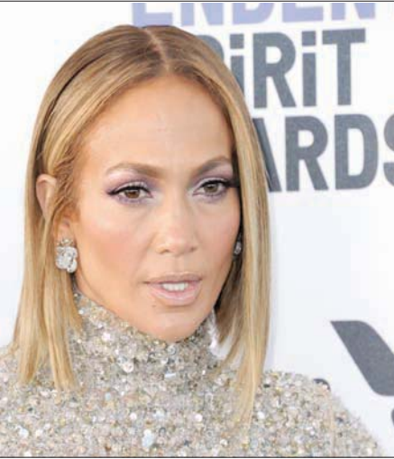
جينفر لوبيز دخلت مؤخراً مجال التجميل

الممثلة والممثلة جينفر لوبيز ليست جديدة على عالم الجمال، فقد أطلقت سابقاً مجموعة من العطور، لكنها دخلت مؤخراً مجال التجميل معتمدة على صورتها. فهي لا تزال تثير الإعجاب بجمالها وبشعرها النضرة والشابة رغم أنها في الـ 50 من عمرها. وهذا تحديداً ما تسعده للترويج لمنتجاتها الجديدة. خلال الجائحة شغلت نفسها بمشروعها الجمالي، «جي لو بيوتي»، الذي تقول إنها تريد أن تكون مشواري المسرحي أطول؛ وهذا صراع أعيشه بسبب تلك التجربة التي وضعتني في جلسة طويلة مع العقل والقلب، وربما يمكنني القول إنني ندمت على تأخري في صعود خشبة المسرح شديد الإمتاع، لذلك أتمنى تقديم هذا العرض المسرحي أطول فترة زمنية ممكنة، بجانب تقديم عروض جديدة ككثير من روعم شعور عز بالندم على التأخر في دخول عالم «أبو الفنون» فإنه يرى في الوقت ذاته أن الظروف أجبرته على عدم اتخاذ تلك الخطوة من قبل، ربما لأن المسرح لم يكن متعشياً بهذا الشكل خلال السنوات الماضية،