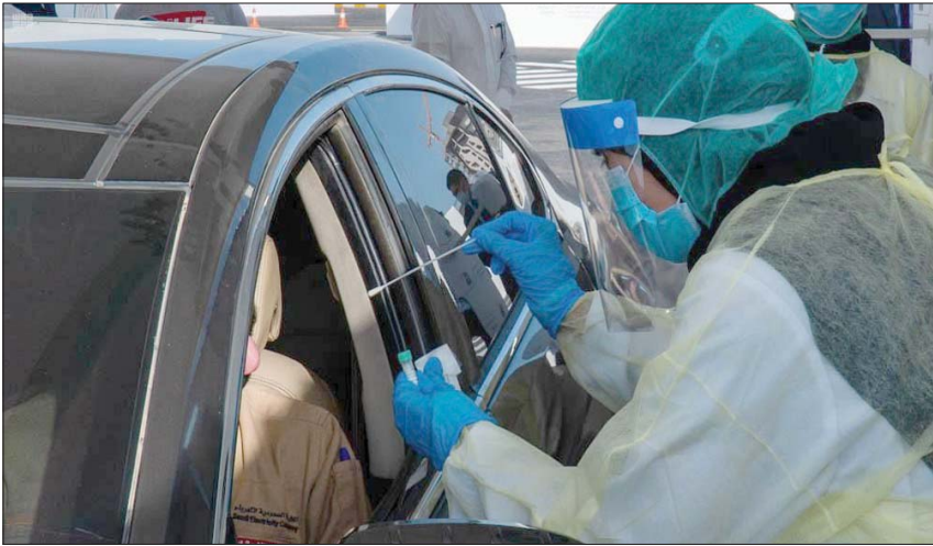
عودة الحياة الطبيعية كاملة في السعودية مع استمرار الفحص الدائم (واس)