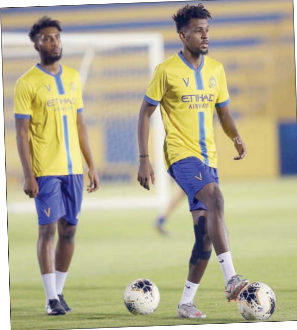
جانب من تدريبات النصر الأخيرة

مباراته أمام الحزم على ملعب جامعة الملك سعود باحثاً عن نقاطها الثلاث التي ستجوز الفريق بلقب دوري الأمير محمد بن سلمان للمحترفين قبل نهايته بجولتين، ويدرك الفريق الأزرق صعوبة مهمته، خاصة أنها تأتي أمام فريق الحزم الباحث عن تحقيق الفوز من أجل الهرب من الهبوط عقب تراجع المركز الخامس عشر إلى المركز الأخير برصيد 27 نقطة. ويتطلع الهلال إلى حسم اللقب على أرضه قبل مغادرته في الجولة المقبلة إلى مكة المكرمة لمواجهة فريق الوحدة، سيدخل الروماني