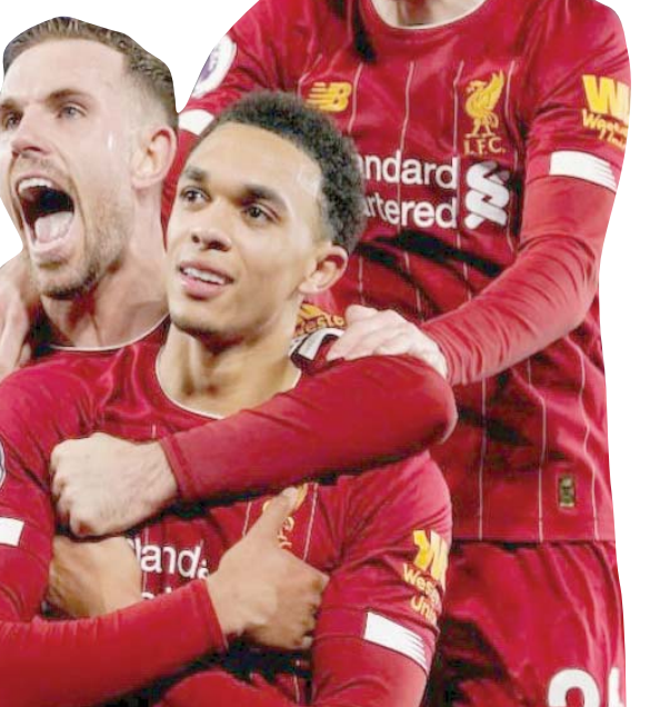
ليفربول حصد لقب الدوري الإنجليزي الموسم الماضي

بمزيد من الألقاب يجب أن تزيد من معدل ضربات القلب