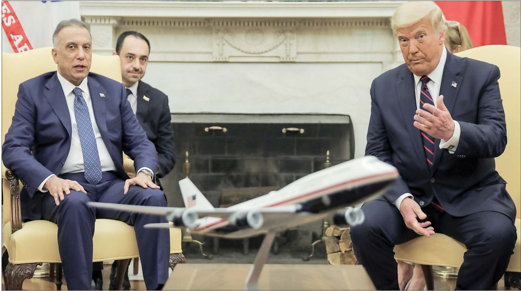
بغداد، «الشرق الأوسط»

الأميركية التي باتت على الأبواب، خصوصاً أن زيارة الكاظمي جاءت في وقت حساس على صعيد الصراعات الإقليمية الحالية. وبالتالي، فإن ترمب سيسعى إلى استثمار هذه الزيارة، لا سيما بعد حسم الديمقراطيون ترشيح جو بايدن رسمياً للانتخابات الرئاسية». أيضاً يرى الدكتور عبد الإله إن «اختلاف الأولويات والمفاهيم هو الذي يهيمن على الزيارة، سواء لجهة عدم حسم توصيف العراق أميركياً الآن لجهة كونه صديقاً أم حليفاً أم شريكاً حتى يمكن البناء عليه. والأمر نفسه في بغداد، حيث كل طرف يريد للكاظمي أن يحقق ما يريد هو لا ما يفرضه سياق العلاقات الدولية وجو المفاوضات. وتابع: «هناك أطراف عراقية طالب الكاظمي بضمانات على صعيد إخراج القوات الأميركية من العراق، بينما أميركا تتحدث عن محاربة داعش». ويشان أولويات الكاظمي، يقول عبد الإله إن «الكاظمي يسعى إلى الاتفاقيات الثنائية عبر تفعيل بنود الاتفاقية الموقعة بين الطرفين لجهة الاقتصاد والطاقة والنفط والاستثمار والكهرباء والمساعدات، ومجمل أبعاد الدعم الذي يحتاج إليه الآن