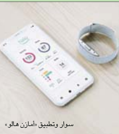
سوار وتطبيق «أمازون هالو»

ويتميز هذا السوار بوظيفة «النبرة» (تون) التي تحدد ما إذا كان صوت حامله يعكس مزاجاً إيجابياً «مما يتبع له أن يعرف كيف ينظر الآخرون إلى نبرته ويعمل تالياً على تحسين أسلوب تواصله معهم وعلاقاتهم بهم»، بحسب بيان للمجموعة. ويمكن لوظيفة «النبرة» مثلاً أن تكشف تأثير اتصال متوتر يتعلق بموضوع مهني على طريقة تواصل صاحب السوار مع عائلته إذا كانت أقل إيجابية من المعتاد، مما يؤثر إلى أثر الإجهاد العصبي على التوازن العاطفي. ويسجل السوار قوة الحركات خلال التمارين الرياضية، ونوعية النوم، وتيرة نبضات القلب وسواها من المؤشرات،