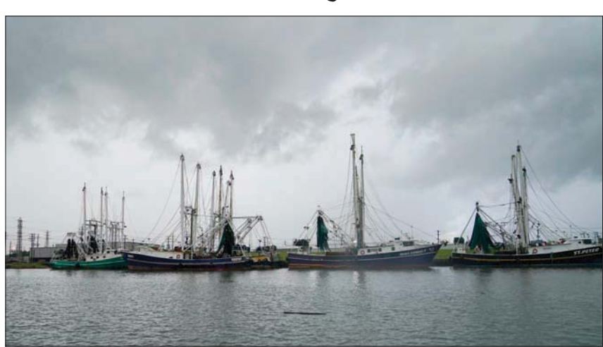
إعصار «لورا» كما بدأ في سماء تكساس يوم الخميس

سرعتها 240 كيلومتراً في الساعة، مما أدى إلى تدمير مبانٍ وسقوط أشجار وانقطاع الكهرباء عما يزيد على 650 ألف شخص في لوزيانا تكساس، لكن مصافي التكرير لم تشهد الفيضانات الهائلة التي كانت متوقعة. وقالت «آر بي سي كابيتال» في مذكرة: «أسعار الخام تحركت بالكاد هذا الأسبوع، لكن هوامش التكرير تضررت، إذ تسببت فيضانات مفاجئة في تعطيل أنماط الاستهلاك العادية، لفترة أطول على الأرجح من بقاء الإنتاج في خليج المكسيك» في حالة توقف. وخلال الأيام الماضية واستعداداً للإعصار، أوقف منتجون أميركيون إنتاج 1,56 مليون برميل يومياً من النفط الخام، أو ما يعادل 83% من إنتاج خليج المكسيك، بينما أوقفت نحو تسع مصافي نحو 2,9 مليون برميل يومياً من طاقة الإنتاج، أو ما يعادل 15% من طاقة التكرير في الولايات المتحدة.