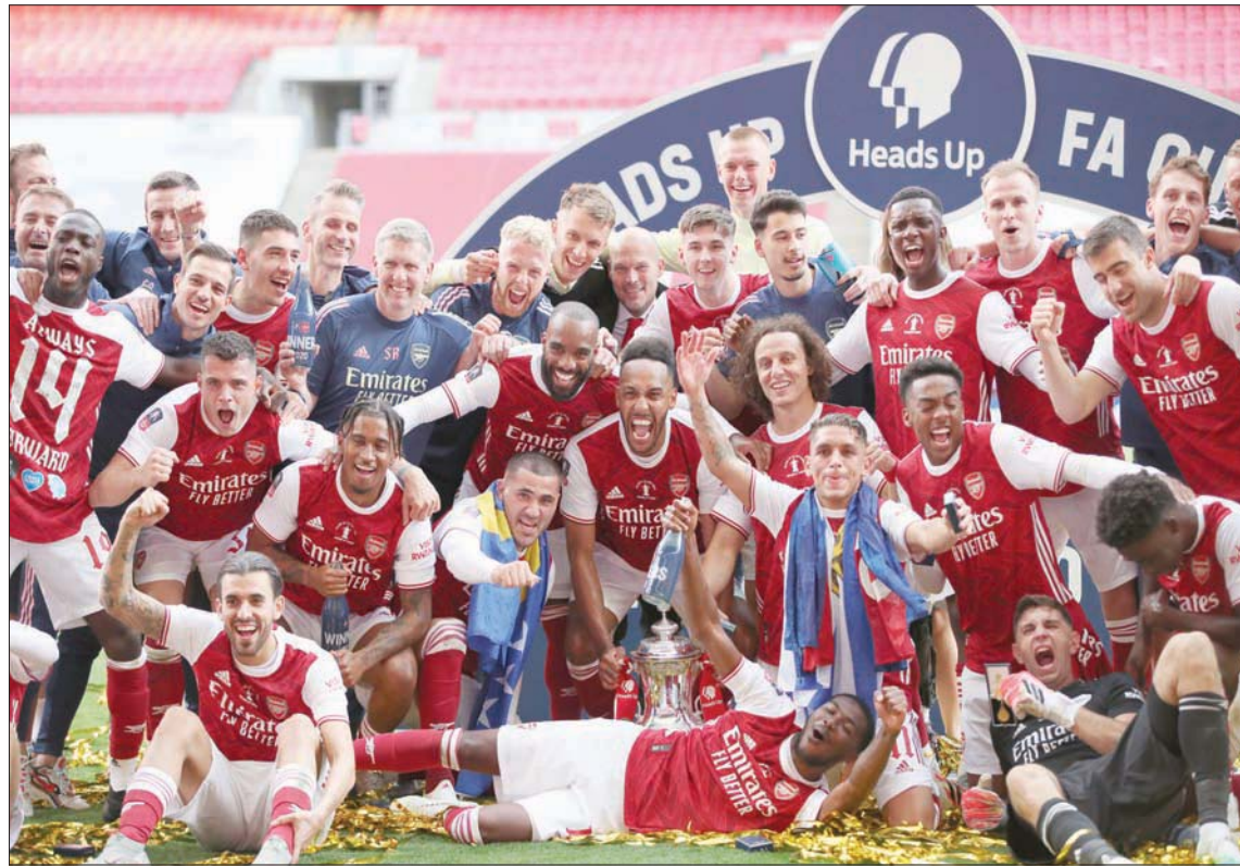
أرسنال بطل كأس إنجلترا الموسم الماضي