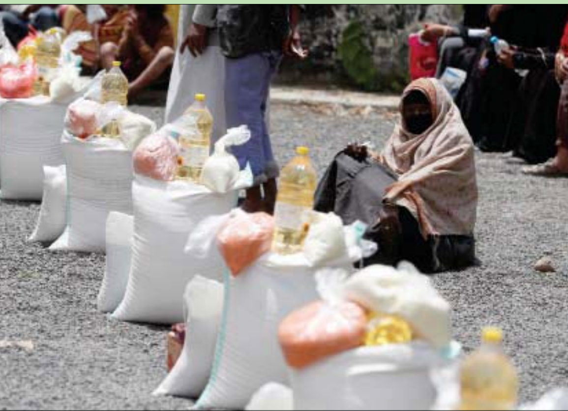
توزيع مساعدات أممية في صنعاء (أ.ب.)

انخداع المواطنين بالأرباح السريعة. وأكد بعض الناشطين لـ«الشرق الأوسط» أن الجماعة المدعومة من إيران تركت تلك الشركات منذ خمسة أعوام ماضية تسرح وتمرح وتمارس النهب والسلب وفق أساليب وطرق ممنهجة بحق أموال وممتلكات اليمينيين بمناطق سيطرتها وعندما سحنت لها الفرصة انقضت عليها ونهبتها كلها. وفي وقت سابق كانت