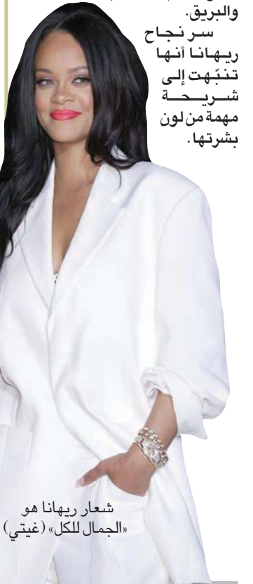
شعار ريهانا هو «الجمال للكل»

منذ أن دخلت المغنية ريهانا عالم الجمال والتجميل في عام 2017، بماركة «فانتسي» وشهية النجمات مفتوحة على هذا المجال. العديداً منهن دخلن بكل قلعهن وما يمتلكن من هذا متابع على وسائل التواصل الاجتماعي