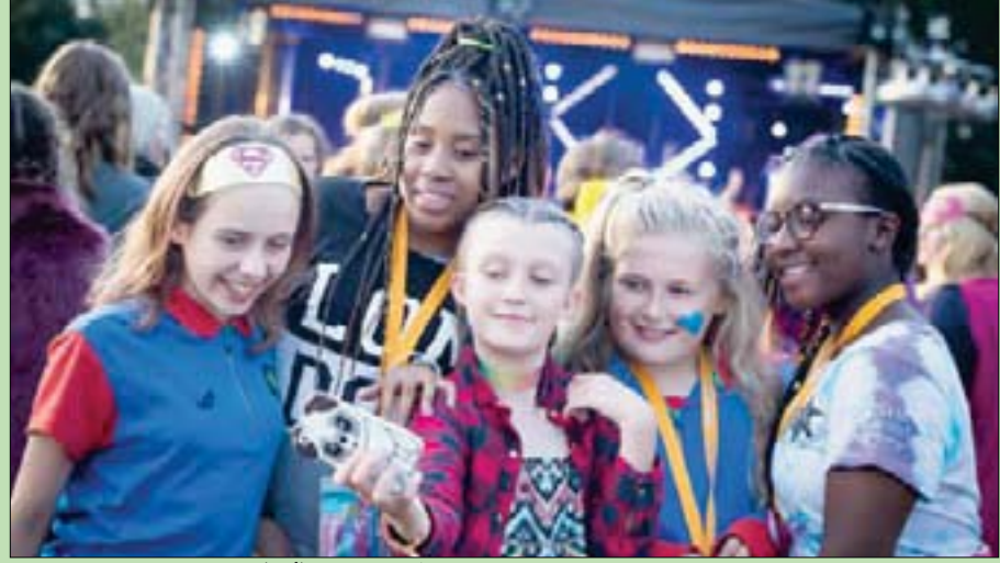
استطلاع «غيرل غايدينغ» السنوي لآراء الفتيات

خلصت إحدى الدراسات البحثية إلى أنّ ثلاث الفتيات والشابات لا يقدمن على نشر صور «سيلفي» ذاتية على الإنترنت من دون استخدام مرشح أو تطبيق على أجل إضفاء التحسينات على الصور لتغيير مظهرهن، بينما حذفت نسبة مماثلة منهن الصور الذاتية تماماً التي نالت قدراً ضئيلاً للغاية من الإعجابات أو التعليقات المؤيدة. وخلص استطلاع «غيرل غايدينغ» السنوي لآراء الفتيات إلى أنّ حوالي النصف من الفتيات يعثرن صورهن بصفة منتظمة من أجل تحسين مظهرهن على شبكة الإنترنت والعثور على القبول المنشود لدى الآخرين.