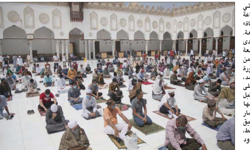
مصلون يؤدون صلاة الجمعة في الجامع الأزهر بالقاهرة

الإعلامي لمجلس الوزراء المصري»، أمس، أنه «لا صحة للسماع بقصد التمرات والاجتماعات الرسمية دون قيود أو إجراءات احترازية، وأنه لم يتم إصدار أي قرارات متعلقة بهذا الشأن»، موضحاً «استمرار العمل بقرار رئيس الوزراء المتعلق بإمكانية عقد التمرات والاجتماعات الرسمية، بحضور 50 شخصاً فقط كحد أقصى، وطاقات استيعابية 100 شخص للقاءات المقام عليها، وذلك ضمن الإجراءات الاحترازية لمواجهة فيروس «كورونا» (المستجد)، مشدداً على أنه «في حال صدور أي قرارات جديدة متعلقة بهذا الشأن سيتم الإعلان عنها بشكل رسمي».