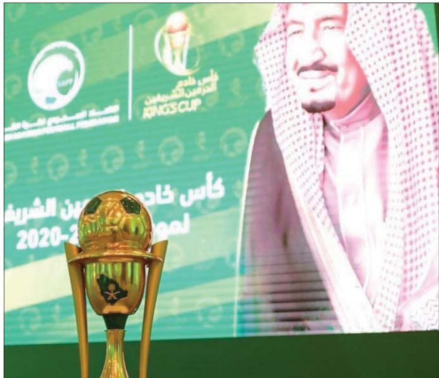
منافسات كأس الملك ستستأنف في أكتوبر المقبل (الشرق الأوسط)

وضمت بطولة كأس الملك 64 فريقاً في دورها الأول، وهي أندية دوري الأمير محمد بن سلمان للمحترفين 16 نادياً، وأندية دوري الأمير محمد بن سلمان لدوري الدرجة الأولى 20 فريقاً، وأندية دوري الدرجة الثانية 24 فريقاً، بالإضافة إلى الفرق الأربعة المتأهلة من تصفيات دوري الدرجة الثالثة. وانطلقت مباريات بطولة كأس الملك في نوفمبر تشرين الثاني الماضي، حيث أقيمت كل الأدوار بنظام خروج المغلوب، دون اللجوء إلى مباريات الذهاب والإياب التي كانت حاضرة في فترة زمنية ماضية.