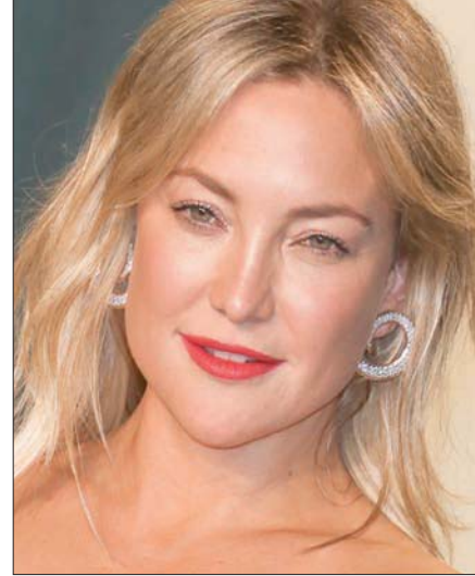
كيت هادسون ركزت على الصحة

خوض التجربة ذاتها أملاً في الحصول على قطعة من المعككة المجزية. كل واحدة من هؤلاء النجمات ترفع شعارها الخاص في السوق مرطب يمكن أن يصحح الحالة. لكن مكملات معينة بالفيتامينات والمعادن يمكنها أن تحسن أجهزة المناعة والهضم وغيرها وهو ما ينعكس على البشرة والشعر بشكل إيجابي. وأوضح: