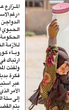
سورية في مخيم للنازحين في الحسكة في وقت سابق من هذا الشهر