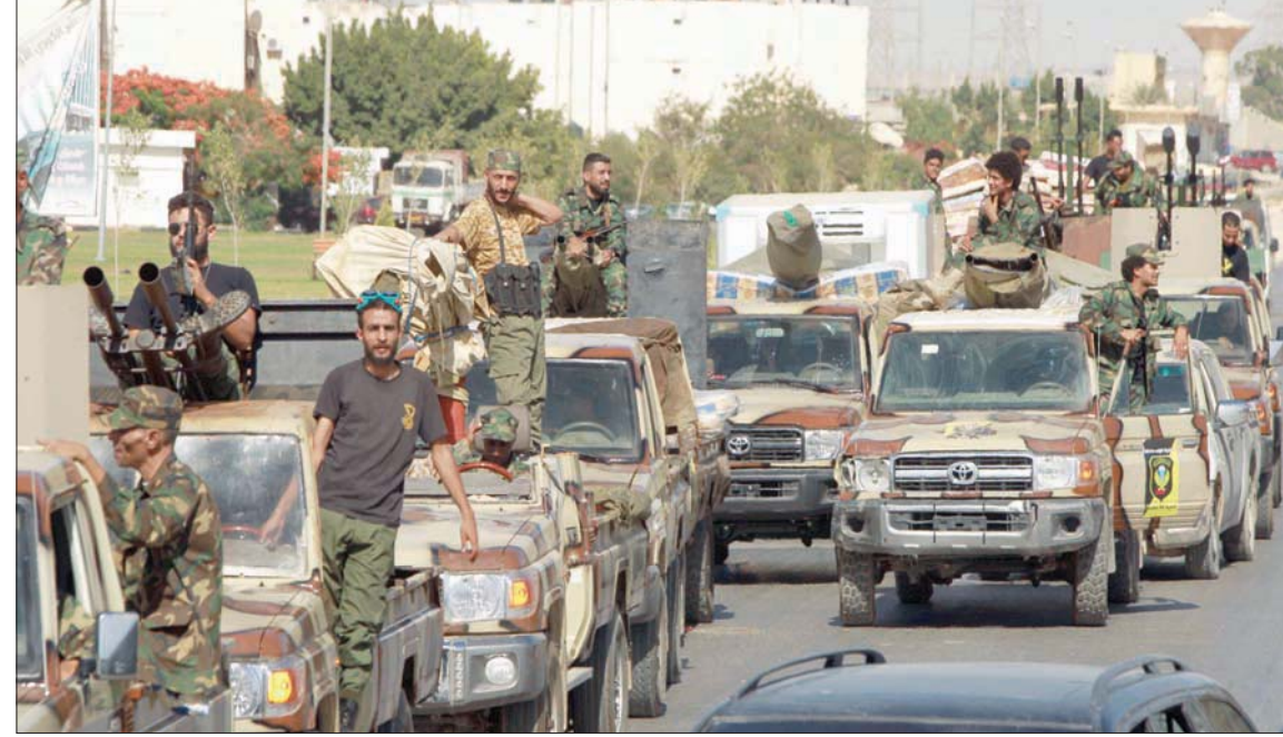
قوات من «الجيش الوطني» متجهة إلى الخط الأمامي قرب سرت في يونيو الماضي