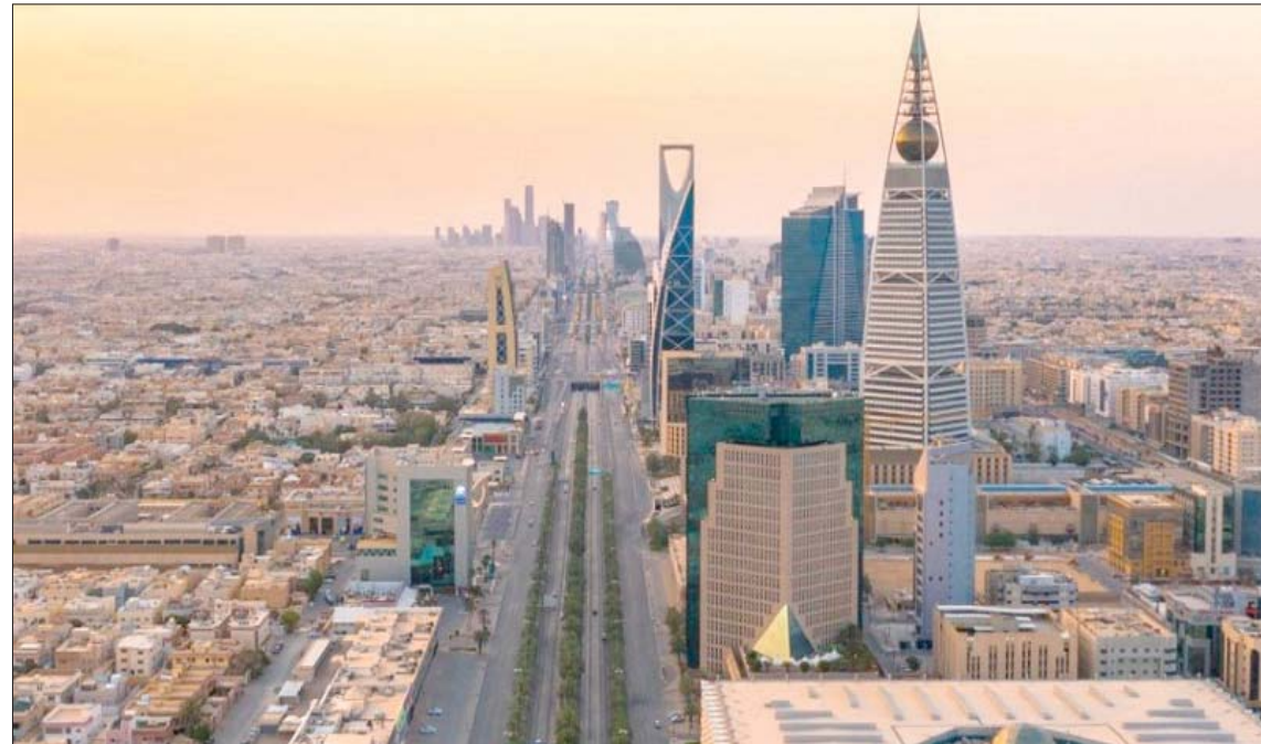
قفزة في نمو السيولة المالية ستعزز من الانتعاش الاقتصادي في السعودية خلال الأشهر المقبلة (الشرق الأوسط)

الرياض: محمد الحميدي كشفت معدلات السيولة الوفيرة التي برزت في القطاع المالي السعودي أخيراً المساهمة في انتعاش مؤشرات الاقتصاد للنصف الثاني، لا سيما ما يتعلق بإمدادات التمويل وثقة الائتمان المصرفي، ما يعزز رؤية إيجابية للاقتصاد الوطني لبقية العام، وتجاوز المرحلة الأسوأ من انعكاسات تداعيات الوباء. ووفق تقارير بيانية عن بنوك استثمارية سعودية، نجح الاقتصاد السعودي في التحول من التباطؤ خلال النصف الأول من العام الحالي، مع تداعيات «كورونا المستجد» والإغلاق الاقتصادي، إلى مرحلة انتعاش واضحة خلال النصف الثاني، بدلالة بعض المؤشرات الاقتصادية الحديثة للقطاع غير النفطي، كمؤشر مناخ الأعمال ومؤشر مديري المشتريات. وترى التقارير أن الاقتصاد السعودي محظوظ بتوفر السيولة التي انعكست على معدلات نمو المعروض النقدي العالية التي نجمت عن ضخ مؤسسة النقد العربي السعودي قادراً كبيراً من السيولة بهدف دعم النظام المصرفي لتمويل القطاع الخاص. وبحسب التقارير التي حصلت «الشرق الأوسط» على نسخة منها، شهد الاقتصاد السعودي خلال العام الحالي سيولة وافرة في أثناء فترة النمو الاقتصادي الضعيف، على عكس ما حصل في عام 2016، حيث كانت هناك أزمة في السيولة، مرجعة ذلك إلى سياسة ضخ مبالغ كبيرة عبر «مؤسسة النقد» لدعم