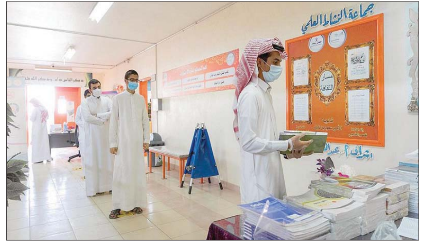
تسليم الكتب المدرسية سبق بدء الموسم الدراسي في السعودية (واس)

الرعاية الصحية اللازمة منذ دخولها المستشفى، وبذلك يكون مجموع حالات الشفاء 59 ألفاً و 861 حالة.