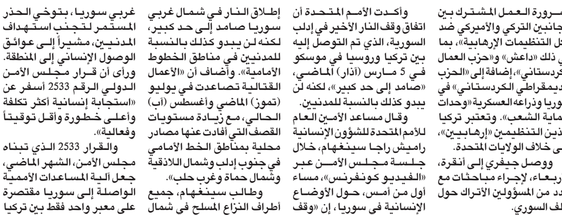
سوريون مؤيدون للمعارضة يشاركون في تجمع أمام أنقاض أبنية مدمرة في أريحا بريف إدلب أمس

نفذت قوات النظام السوري قصفاً صاروخياً مكثفاً، أمس، على مناطق بجبل الزاوية في ريف إدلب الجنوبي، في وقت جددت تركيا عزمها الحفاظ على وقف إطلاق النار في إدلب ومنطقة خفض التصعيد في شمال غربي سوريا على رغم ما تصفه بـ«انتهاكات» النظام السوري للهدنة. ويحث المتحدث باسم الرئاسة التركية إبراهيم كالين، مع المبعوث الأميركي الخاص إلى سوريا جيمس جيفري، خلال لقائهما في إسطنبول، أمس (الجمعة)، تطورات الأزمة السورية والقضايا الإقليمية. وتحاول المسؤولون التركي والأميركي الأزمة السورية من مختلف جوانبها، في المقدمة الوضع الراهن في إدلب والعملية السياسية وأعمال اللجنة الدستورية ومكافحة الإرهاب وقضية اللاجئين، وأفيد بأنه تم الاتفاق في الاجتماع على ضرورة تخفيف الجهود المشتركة لتسريع عمل اللجنة الدستورية، وتأسيس بيئة لانتخابات حرة وعادلة، وضمن العودة الطوعية والأمنة للاجئين، في مواجهة محاولات النظام «تقويض» العملية السياسية. كما تم التأكيد على عدم قبول جميع أشكال الدعم للمنظمات الإرهابية، حسب ما قالت أنقرة. وأكد كالين، في هذا الإطار،