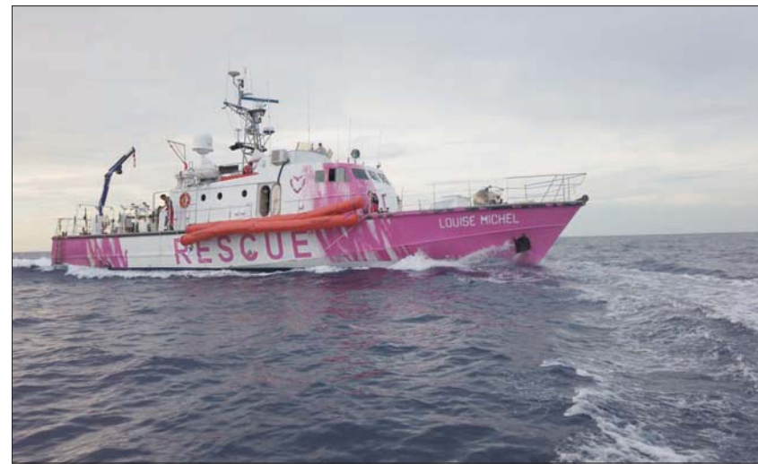
سفينة إنقاذ المهاجرين «لويز ميشيل» التي مولها بانكسي

صغيرة الحجم لكنها أسرع بكثير من سفن المنظمات غير الحكومية العاملة في المنطقة ما يسمح لها بالتغلب على خفر السواحل الليبي. وأكدت صحيفة «الغارديان» أن بانكسي لن يكون على متنها، مضيفة أن العملية برمتها تمت بين لندن وبرلين وبورينا في سزيرة تاما، حيث رست السفينة «الوين ميشيل» لتكون مجهزة لعمليات الإنقاذ البحري. وخشي الطاقم من أن اهتمام وسائل الإعلام قد يضر بأهدافهم إذ انتشرت أخبار عن أن