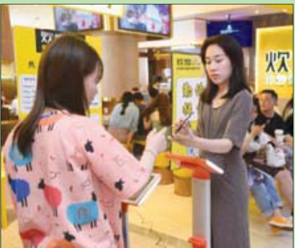
امرأة ترن نفسها قبل دخول المطعم لتناول الطعام

ولا تعد سلسلة مطاعم «تشوييان فرايد بيف» الوحيدة التي تفرض القواعد الأكثر صرامة بشأن استهلاك المواد الغذائية لديها. ففي الأسبوع الماضي، دعت جمعية خدمات المطاعم في مدينة ووهان المركزية رواد المطاعم إلى طلب الأطباق من طراز «إن وان»، أو أطباقاً بأعداد أقل من عدد الأشخاص الذين يتناولون الطعام داخل المطعم في المرة الواحدة. ولقد حذرت تطبيقات الهواتف الذكية المعنية بإظهار التوجهات الأكثر شعبية بالنسبة للأشخاص الذين يتناولون كميات كبيرة من الطعام من احتمال حظر منتجات المحتويات المرئية التي تروج لممارسات تناول الطعام بصورة مفرطة.