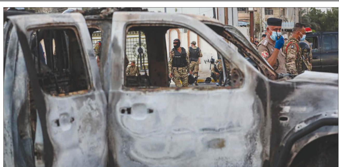
سيارة تابعة للشرطة أحرقتها مظاهرون في البصرة أول من أمس