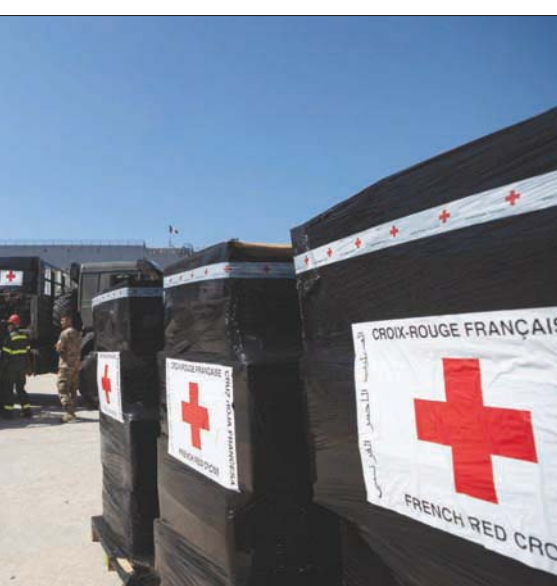
جنود فرنسيون يساعدون أمس في إنزال مساعدات إنسانية مرسلة من الصليب الأحمر الفرنسي

وانطلاقاً مما تقدم اعتبربت خوري أنّ لبنان يتجه وبسرعة كبيرة نحو «الهاوية» في موضوع «كورونا»، فأشلت إن المكايح الوحيدة تتمثل في «الالتزام بالإجراءات الوقائية من تباعد اجتماعي ووضع كمامات وغسل الأيدي»، مشيرة إلى أنّ إقفال البلد الذي قد تلجا الحكومة إلى إعلانه «يساعد طبيعياً الحال بالسيطرة على الوضع ولكنه وحده لا يكفي ولا سيما أن دون تطبيقه بالشكل المطلوب عواقب عدة تتعلّق بحاجة الناس للعلاج وإصلاح منازلها التي تضررت بفعل الانفجار ونحن على أبواب الشتاء».