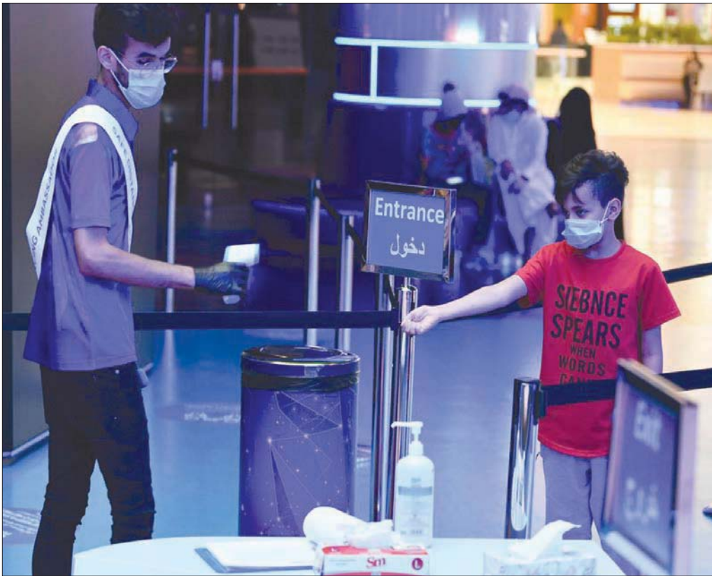
الالتزام بالإجراءات الاحترازية ساهم في تقليل عدد الإصابات في السعودية

وفيما يتعلق بأخر إحصائيات «كورونا» المستجد، أعلنت وزارة الصحة في السعودية أمس تسجيل 1432 حالة تعافٍ جديدة، ليصل عدد المتعافين إلى 268 ألفاً و385 حالة. وفيما يتعلق بالحالات الجديدة المصابة، تم تسجيل 1372 حالة مؤكدة جديدة مصابة بالفيروس، ليصبح عدد الحالات المؤكدة في المملكة 299 ألفاً و914 حالة، من بينها 280 ألفاً و93 حالة نشطة لا تزال تتلقى الرعاية الطبية، فيما بلغ عدد الوفيات 3 آلاف و436 حالة، بإضافة «28» حالة وفاة