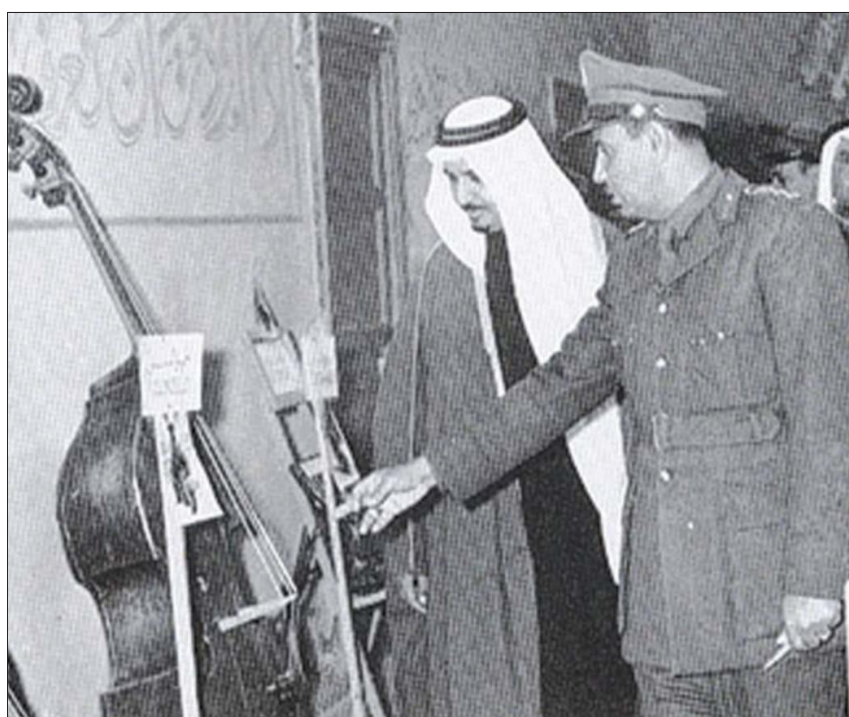
مع ولي العهد آنذاك الأمير سلطان بن عبد العزيز في افتتاح المتحف الموسيقي بالرياض