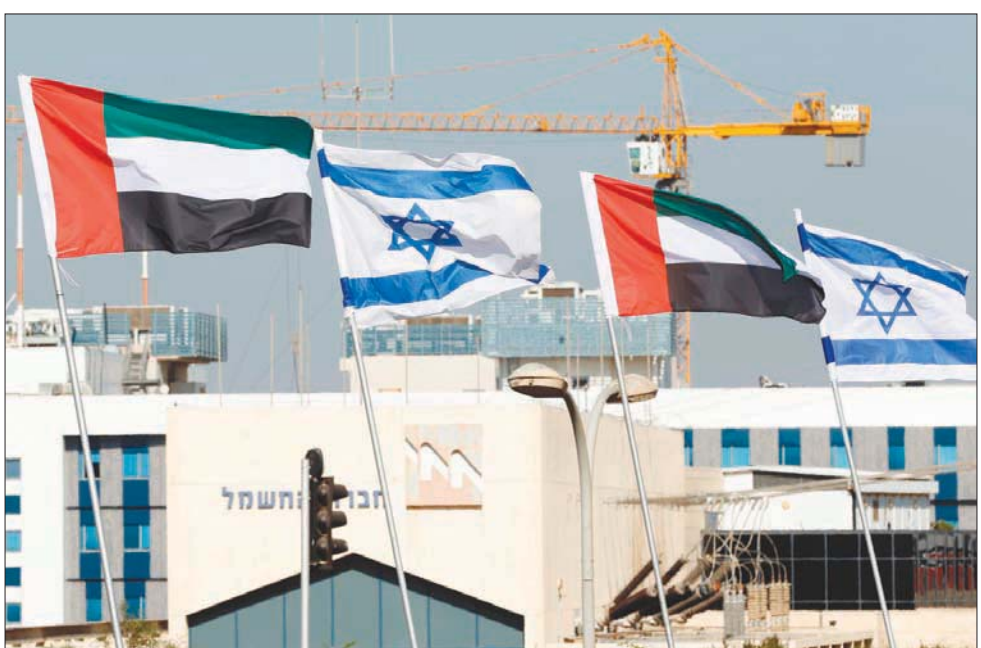
علماء الإمارات وإسرائيل على طريق في مدينة نتانيا الساحلية الإسرائيلية

تداعيات خطيرة على أمن واستقرار منطقة الخليج العربي، وتتخافى مع الأعراف الدبلوماسية. وفي غضون ذلك، وجه الرئيس الإسرائيلي، رؤوفين ريفلين، أمس، دعوة لولي عهد أبوظبي الشيخ محمد بن زايد لزيارة إسرائيل، قائلاً في رسالة باللغة العربية: «باسمي، وباسم الشعب في إسرائيل، أستهل الفرصة لوجه لفخامتكم الدعوة لزيارة إسرائيل والقدس، والحلول ضيقاً معزراً مكراً لدينا». وكتب ريفلين، في الرسالة التي حصلت لصحافة الفرنسية على نسخة منها: «في هذه الأيام المصرية، تختبر الزعامة في شجاعتها وقدرتها على الريادة والرؤية بعيدة المدى». ومن جهته، قال جاريد كوشنر، مستشار الرئيس الأميركي، إن التنازلات التي قدمتها إسرائيل تظهر أنها جادة في مساعيها للسلام، متوقعاً أن تساهم العلاقات مع إسرائيل، مساهمة للتوسع خلال السنوات الأربع المقبلة، بما يتيح المجال لتأسيس دولة فلسطينية خلال هذه السنوات، مشيراً إلى أن الإمارات رأت في معاهدة السلام حلاً للخلاف بين الطرفين، مما يعطي أملاً للفلسطينيين في إمكانية التوصل إلى اتفاق. وأضاف كوشنر، في مؤتمر صحفي