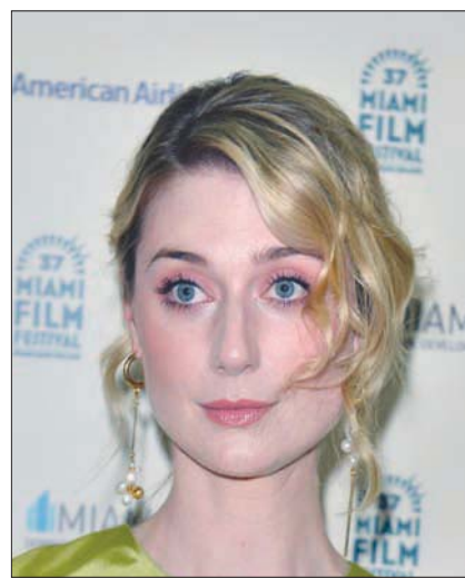
إيزابيث ديببكي تقوم بدور الأميرة ديانا