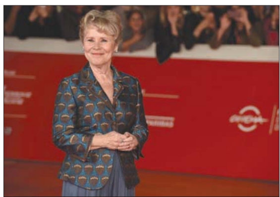
ميلدا ستنتون ستسلم من أوليفيا كولمان دور الملكة إليزابيث

ومن المتوقع أن يعرض الجزء الرابع في الخريف المقبل، وسيشمل أول ظهور لشخصيات الأميرين ويليام وهاري في مرحلة الطفولة.