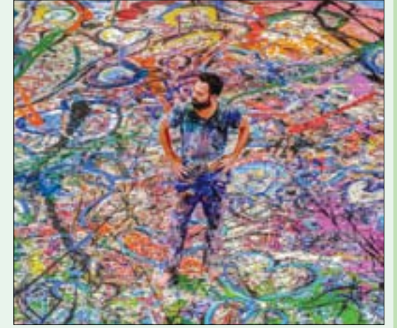
سانشا جفري يستعد لإعداد أول لوحة من نوعها (الشرق الأوسط)

دبي، «الشرق الأوسط» أطلقت «دبي العطاء» إحدى مبادرات محمد بن راشد آل مكتوم العالمية بالتعاون مع الفنان العالمي سانشا جفري، مبادرة «إنسانية ملهمة» تتضمن إعداد أول لوحة فنية من نوعها في العالم ترسم على القماش، تحتفظ بها الإمارة الخليجية أن تحطم الرقم القياسي لموسوعة «غينيس» كأكبر لوحة فنية في العالم. وتهدف هذه المبادرة، المستوحاة من رؤية الفنان سانشا حول تعزيز التواصل بين الناس بعد وباء «كوفيد-19»، من أجل معالجة الآثار السلبية للجائحة على الأطفال والشباب، إلى جمع أكثر من 110 ملايين درهم (30 مليون دولار) للتواصل مع مليون شخص حول العالم، ودعم «دبي العطاء» وشركائها، وبشكل خاص منظمة الأمم المتحدة للتربية والعلم والثقافة (اليونسكو)، حيث ستطلق الجهات الثلاث مبادرة عالمية لتوسيع نطاق الاتصال الرقمي بهدف ضمان الحد الأدنى من استمرار العملية التعليمية وتوفير فرصة الحصول العادل على التعليم عن بعد لجميع الأطفال والشباب حول العالم. وستدعم مبادرة «إنسانية ملهمة» حسب المعلومات الصادرة أمس مؤسسة «غلوبال غيفت» أيضاً التي ستركز على هدفها الخيري الأساسي، المهتم في دعم تعليم الأطفال ورعايتهم، وتستهدف أولئك الأكثر حاجة، في ظل جائحة «كوفيد-19». وينضم إلى هذه المبادرة شركاء من القطاع الحكومي في دولة الإمارات، بما في ذلك وزارة التسامح والتعايش، ووزارة التربية والتعليم، بالإضافة إلى دائرة