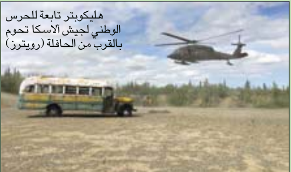
هليكوبتر تابعة للحرس الوطني لجيش الاسكا تحوم بالقرب من الحافلة

بزيارتها، ولكن بأمان واحترام، «ومن دون شبهة الترحيب»، حسب كوري فيجي، مفوض إدارة الموارد الطبيعية في ولاية الاسكا. وما يزال المتحف والسلطات بحاجة للعمل على التفاصيل، لذا فلن يتمكن الزوّار من مشاهدتها إلا بعد عدة أشهر على الأقل.