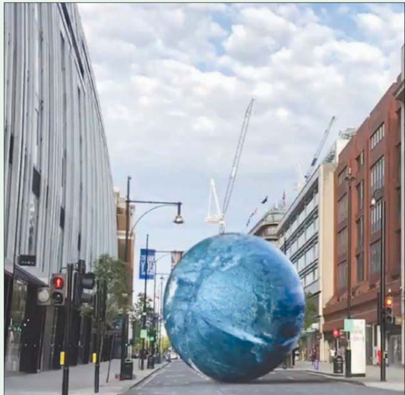
جانب من عرض ترويجي لمشروع «بروجيكت إيرث» في شارع أكسفورد أسس

المادية، ورغبات البعض الآخر في الالتزام بالمبادئ الأخلاقية التي يؤمنون بها. بل يتوقع الكثير من الخبراء أن مواقع السلع المستعملة الأخرى مهما كانت رخيصة من هذا المنظور، تعاونت «سيلفريدجز» مع «هير كوليكثيف» لإطلاق خدمة التأجير. فهذه الأخيرة منصة معروفة تأسست منذ سنوات بهدف الاستفادة والأناقة، وبالتالي لها باع طويل ومصداقية في تأجير قطع فخمة مقابل 20 في المائة فقط من سعرها الكامل، وتشهد إقبالاً كبيراً من قبل النجمات وسيدات المجتمع على حد سواء، لا سيما أن الأضواء المصممة تحتاج إلى تزكية من زبون سابق وموثوق به.