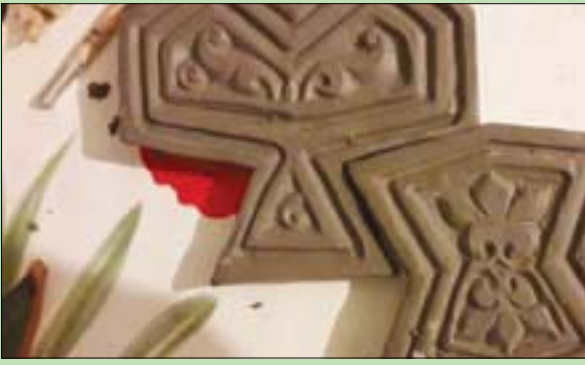
قطعة مستوحاة من التراث

القاهرة، نادية عبد الحليم جواهر الفنون والعمارة الإسلامية، من زخارف وتكوينات لونية فريدة، نستطيع أن نستعيد بها برؤية معاصرة جديدة، واستخدامات يومية تضيف لمحات من الجمال والأصالة على الحياة، عبر مجموعة متنوعة من القطع الفنية المستلهمة من المنابر الملوكة في مصر، بإطار مشروع «جديد من قديم» الذي يأتي ضمن نهاية المرحلة الثانية من مشروع حضاري أكبر أطلقته «المؤسسة المصرية لإنقاذ التراث»، بالتعاون مع وزارة السياحة والآثار والمجلس الثقافي البريطاني. وتحت عنوان «إنقاذ المنابر الملوكة». ومواكبة لأعمال الترميم لأكثر من 75 عامًا من التراث المصري، وترأس السياحة والآثار والمجلس الثقافي البريطاني. وتحت عنوان «إنقاذ المنابر الملوكة». ومواكبة لأعمال الترميم لأكثر من 75 عامًا من التراث المصري، وترأس السياحة والآثار والمجلس الثقافي البريطاني.