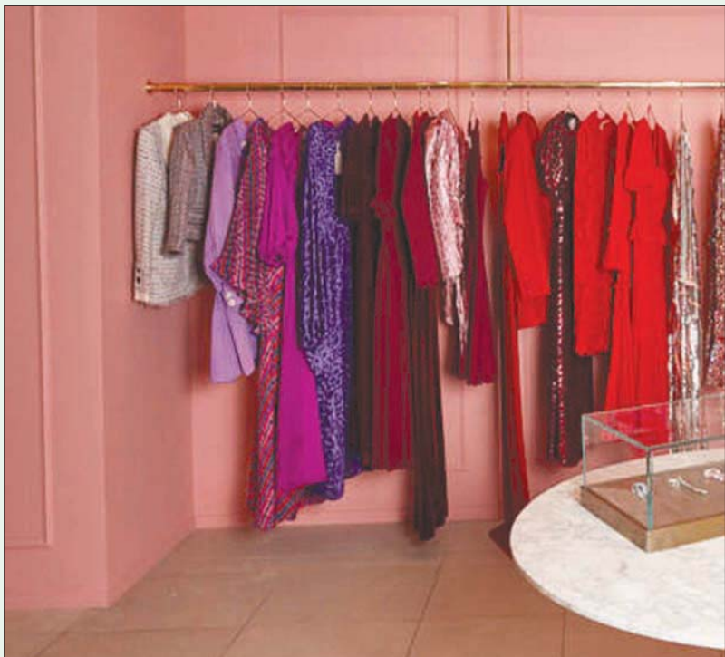
الركن الخاص ببيع الأزياء المستعملة في «سيلفريدجز»

تجدر الإشارة إلى أن «سيلفريدجز» واحدة من بين الكثير من المحال والأسماء العالمية، مثل محال «زارا» و«إيش أند إم» و«جون لويس» و«غوتشي»، إضافة إلى محال «إيكيا»، انتبهت للاهمية الموضحة المستدامة، ووقعت في العام الماضي اتفاقاً لتتخذ بموجبه بكل المعايير البيئية والإنسانية.