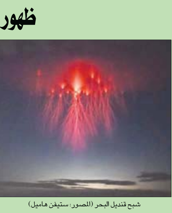
شبح قنديل البحر

قد أصبحت مقصداً لبعض المتزهمين بعدما توفي ماكدنلس هناك بفردة في عام 1992. حسباً هو موثق في كتاب «إلى البرية» لجون كراوكور الصادر في 1996. الذي تحول لفيلم في 2007. وأزيلت الحافلة من موقعها الخائبي نسبياً بعدما توفي العديد