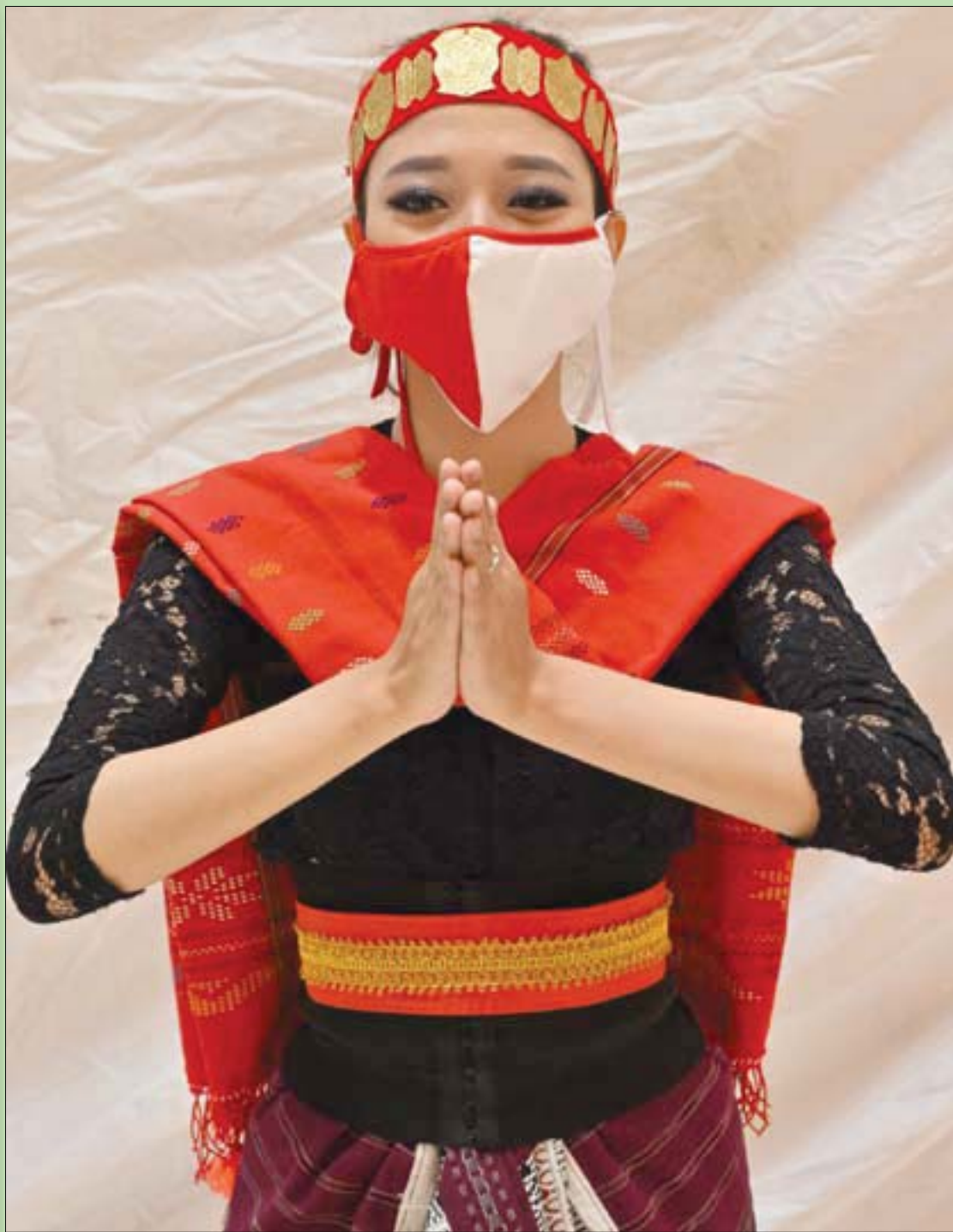
راقصة ترتدي ملابس تراثية وكمامة ملونة أثناء مشاركتها في عرض للاحتفال بـ«اليوم الوطني» لإندونيسيا في جاكرتا

السؤال الأخير: لماذا تتخوف رؤوس كبيرة من التحقيق الدولي؟!... هل المسألة فيها (إن).