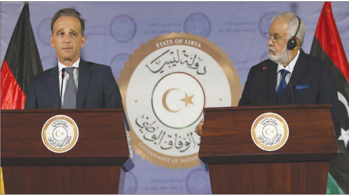
وزير الخارجية الألماني هايكو ماس خلال لقائه وزير الخارجية الليبي في طرابلس أمس

ونقلت وكالة «نواف» الإيطالية عن مصدر مطلع من حكومة الوفاق الوطني أن جدول الزيارة كان يتضمن مناقشة الخطوات