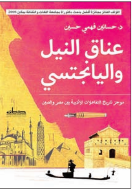
عناق النيل واليانجسي

في البغاء في اللص والسكراب»، والمرأة الريفية «زهره» في «ميرامير»، أما لاو شه فقد أجاد الكتابة عن نساء بكن اللاتي ينسبن للطبقتين الدنيا والمتوسطة، وعبر عن مشكلات المرأة والظلم الذي تعرضت له في ظل التغييرات السياسية والاجتماعية الكبيرة التي شهدتها الصين قبل تأسيسها كدولة حديثة. وقسم الباحث في الكتاب الشخصيات النسائية التي قدمها لاشي إلى ثلاث فئات، الأولى المرأة التقليدية، وتميزت بالقدرة على تحمل مصاعب الحياة، وتمثلها شخصية «يون مبي» في رواية «ربع أجيال تحت سقف واحد»، وتأتي في مقابلها شخصية «الميمية» الشهيرة في ثلاثية محفوظ، وتتشبه شخصية «شيواو فونجسي» المصير الجانس ذاته، حسب ما يشير الباحث، لشخصية «فيسية» في رواية «بداية ونهاية» لنجيب محفوظ، وهي خير نموذج للمرأة المنطلقة البائسة التي اضطرها الفقر إلى السقوط وبيع نفسها، وعندما واجهتهما الحياة بأصعب ما فيها من متاعب ومحن ومعاناة، لم تجد أي منهما أمامهما إلا الانتحار.