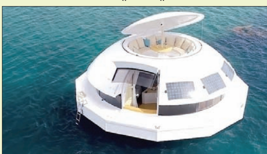
وفقاً لموقع «يانكو ديزاين».