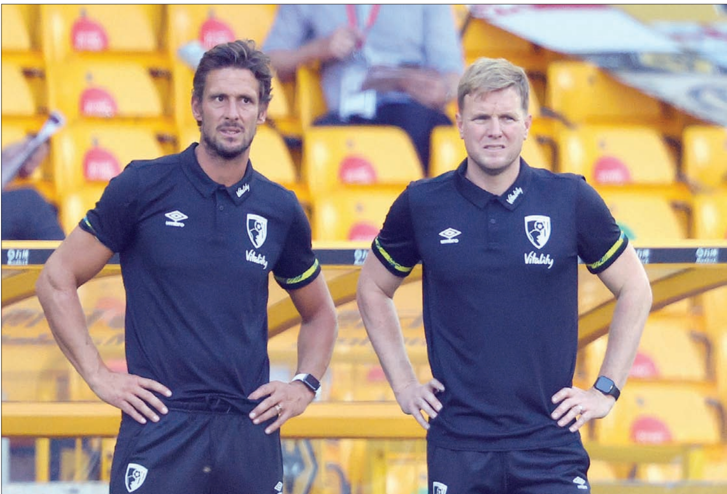
تيندال (يسار) بجوار هاو في بورنموث قبل رحلة الهبوط

أهمية التحول من «مساعد» إلى «مدير فني» في نظر لاعبيه بعد أن واجه صعوبات في البداية في تأكيد سلطته كمدرب فني بين زملائه السابقين. وخلال الأسبوع الماضي، أوضح هاري ريدناب أن هناك اختلافاً كلياً بين العمل كمساعد ومدرب فني، لأن استبعاد المدير الفني لعدد من اللاعبين من التشكيلة الأساسية يؤدي إلى انخفاض شعبيته بصورة كبيرة بعد أن كان الشخص محبوباً من الجميع عندما كان يعمل مساعداً.