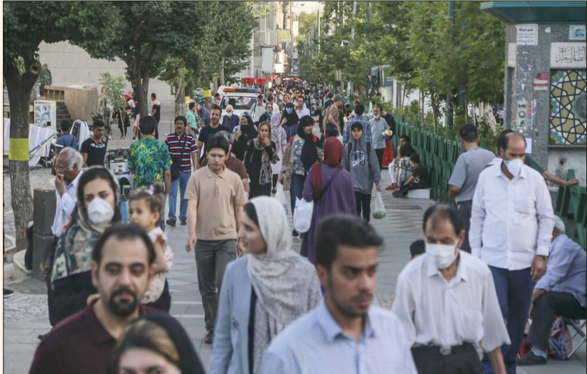
اكتظاظ في شارع وسط طهران المنصفة في الوضع الأحمر نتيجة تفشي «كورونا» أمس

إلى لقاح يكافح وباء كورونا». ومع ذلك، أشار إلى محاولة عدة فرق طبية إيرانية للحاق بالجهود العالمية من أجل إنتاج لقاح «كورونا» ونقلته عنه وكالة «إيسنا» الحكومية أن «ما هو واضح أن إنتاج لقاح كورونا سيطول». ودخلت إيران موجة ثانية، بعدما سمحت باستئناف الأنشطة الاقتصادية في 11 أبريل (نيسان) الماضي، عقب فرض قيود محدودة على الأنشطة رغم أنها لم تفرض الحجر الصحي بشكل تام.