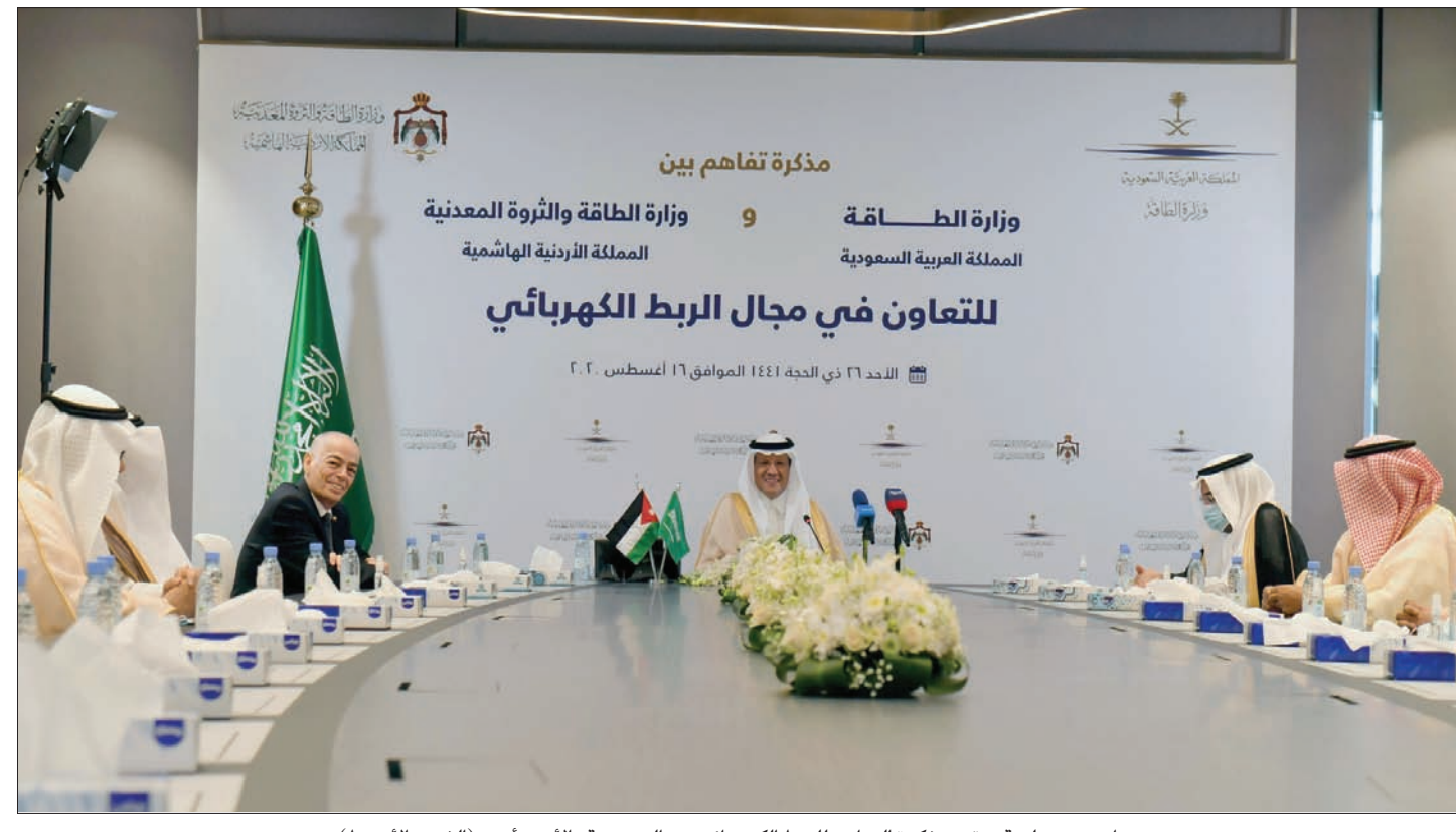
جانب من جلسة توقيع مذكرة التعاون للربط الكهربائي بين السعودية والأردن أمس (الشرق الأوسط)

خاصة في عهد الثورة الصناعية الرابعة وتوجه العالم نحو التكنولوجيا الرقمية.