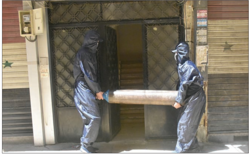
متطوعون يمدون مرضى «كورونا» بعبوات أكسجين في دمشق الأحد الماضي

في حصيلة صادمة، نشرت «شبكة أطباء سوريا الإعلامية» قائمة بأسماء 63 طبيباً سورياً قالت إنهم توفوا جراء إصابات بوباء «كوفيد-19» خلال الأيام الأخيرة، في حين أن العدد الرسمي لعموم للوفيات بهذا الوباء في سوريا منذ الإعلان عن رصد أول إصابة في مارس (آذار) الماضي هو 60 حالة وفاة لغاية يوم الأحد. وقالت «شبكة أطباء سوريا الإعلامية» عبر حسابها في فيسبوك إن القائمة تضم أسماء 60 طبيباً «خسرتهم سوريا خلال الأيام الماضية» وهم من خبرة الأطباء، وأضافت للقائمة ثلاثة أطباء توفوا خلال الأربع والعشرين ساعة قبل نشر القائمة.