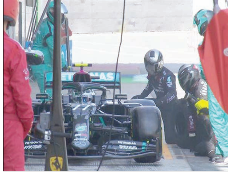
أحد المشاركين خلال عملية تبديل الإطارات

التي ستحصل عليها بوصفها شريكاً عالمياً مع «فورمولا 1». وتتمتع «أرامكو السعودية» بحقوق الرعاية لثلاثة سباقات كبرى هي سباقات: «فورمولا 1» في المجر، وإسبانيا، وسباق «الجائزة الكبرى» الخاص في ألمانيا المقرر إقامته هذا العام. وستحظى «أرامكو السعودية» هذه السباقات «موقف الشركة القوي، ومرونتها الفاعلة في جميع أعمالها، بما لا يتأثر بالتحديات العارضة، وإلا لما أعلنت عن هذه الرعاية إذا كان لها تأثير سلبي على خطتها». وتظهر العلامة التجارية لـ «أرامكو السعودية» على جانب المضمار في سباقات «فورمولا 1» حول العالم، ضمن حزمة المزايا الكربونية بحلول عام 2030. ورغم تأخر إطلاق موسم الرياضات الكبرى التي عادت إلى المنافسة، ولذلك اكتمل إجراء 5 سباقات بالفعل في هذا الموسم، مع زيادة نسب المشاهدة ومستوى الإنارة. وتحت رعاية «أرامكو السعودية» هذه السباقات «موقف الشركة القوي، ومرونتها الفاعلة في جميع أعمالها، بما لا يتأثر بالتحديات العارضة، وإلا لما أعلنت عن هذه الرعاية إذا كان لها تأثير سلبي على خطتها». وتظهر العلامة التجارية لـ «أرامكو السعودية» على جانب المضمار في سباقات «فورمولا 1» حول العالم، ضمن حزمة المزايا