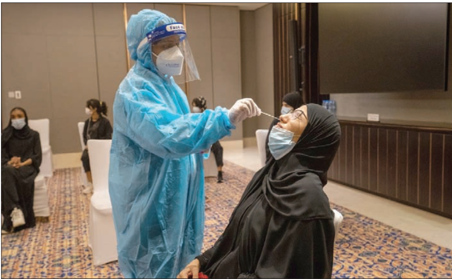
جانب من عمليات فحص «كورونا» في الإمارات

الاولى على تحلي أفراد المجتمع كافة بأعلى قدر من المسؤولية والالتزام بالتدابير الوقائية التي حددتها الجهات المعنية. وقال إن «أي تراخٍ أو إهمال في الالتزام بالشروط والتدابير الوقائية قد يؤدي إلى