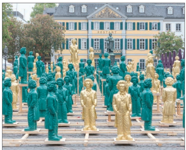
فايونا ماوكس* ترجمة: د. سعد البازعي

بمناسبة موزارت - فسيمكنك أن ترى أوكسفورد، كتابها غير الأكاديمي الأول بوضوح، شارحة المصطلحات دون كلل وبسر؛ امران يصعب الجمع بينهما.