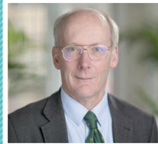
السير تشارلز غودفري