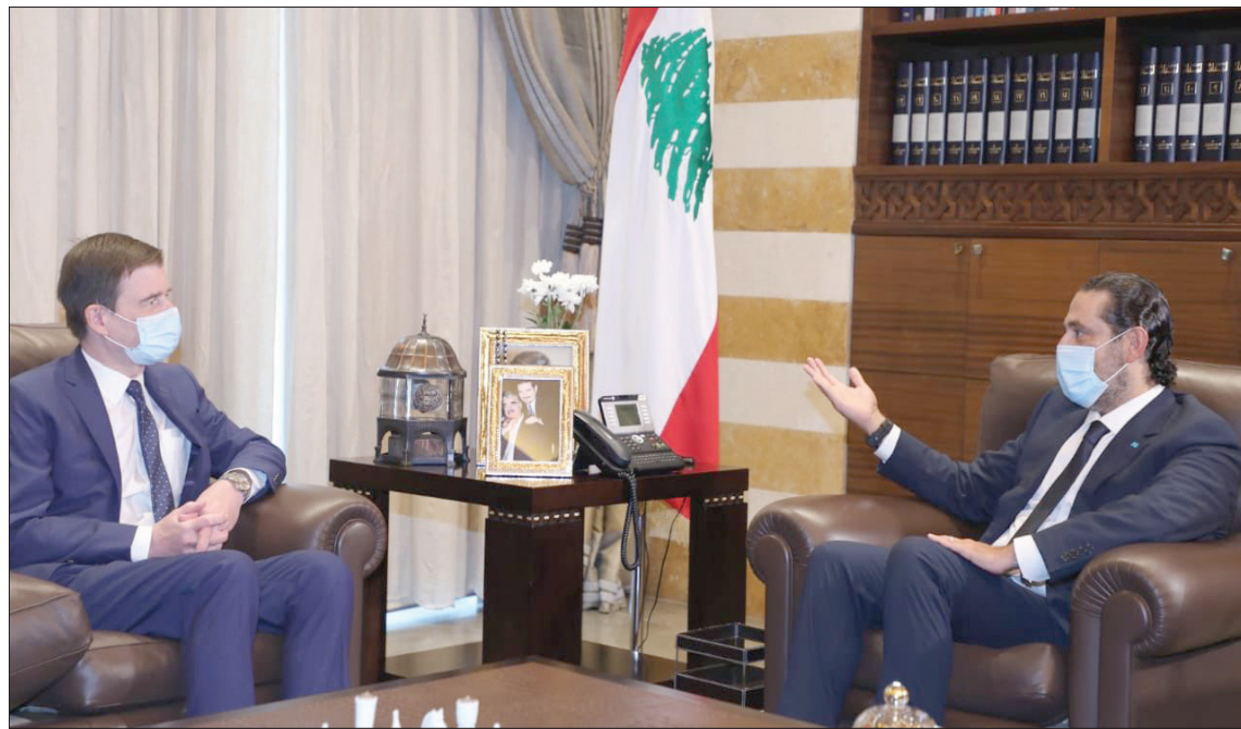
الحريري مجتمعاً مع هيل لدى زيارته بيروت

بيروت، محمد شقير سالت أوساط سياسية لبنانية عن الأسباب الكامنة وراء عدم مبادرة رئيس الجمهورية ميشال عون إلى تحديد موعد لإجراء الاستشارات النيابية الملزمة لتسمية رئيس الحكومة المكلف بتشكيل الحكومة الجديدة، وما إذا كان لترتيبه في إعادة إنتاج السلطة في لبنان علاقة مباشرة بضرورة تجاوز التبعات المترتبة على استعداد المحكمة الدولية لإصدار حكمها اليوم (الاثنين) في جريمة اغتيال رئيس الحكومة الأسبق رفيق الحريري، أم أنه يتوخى من التأخير كسب الوقت لتعويم رئيس «التيار الوطني الحر» النائب جبران باسيل من خلال مطالته بتشكيل حكومة أقطاب تتيج له بأن يعيد الاعتبار لباسيل؟ وكشفت الأوساط السياسية لـ«الشرق الأوسط» أن الرئيس عون يتذرع بضرورة إجراء مشاورات سياسية تسبق تحديد موعد للاستشارات النيابية الملزمة لعله يتمكن من تسويق باسيل من خلال إصراره على تشكيل حكومة أقطاب، وقالت إنه