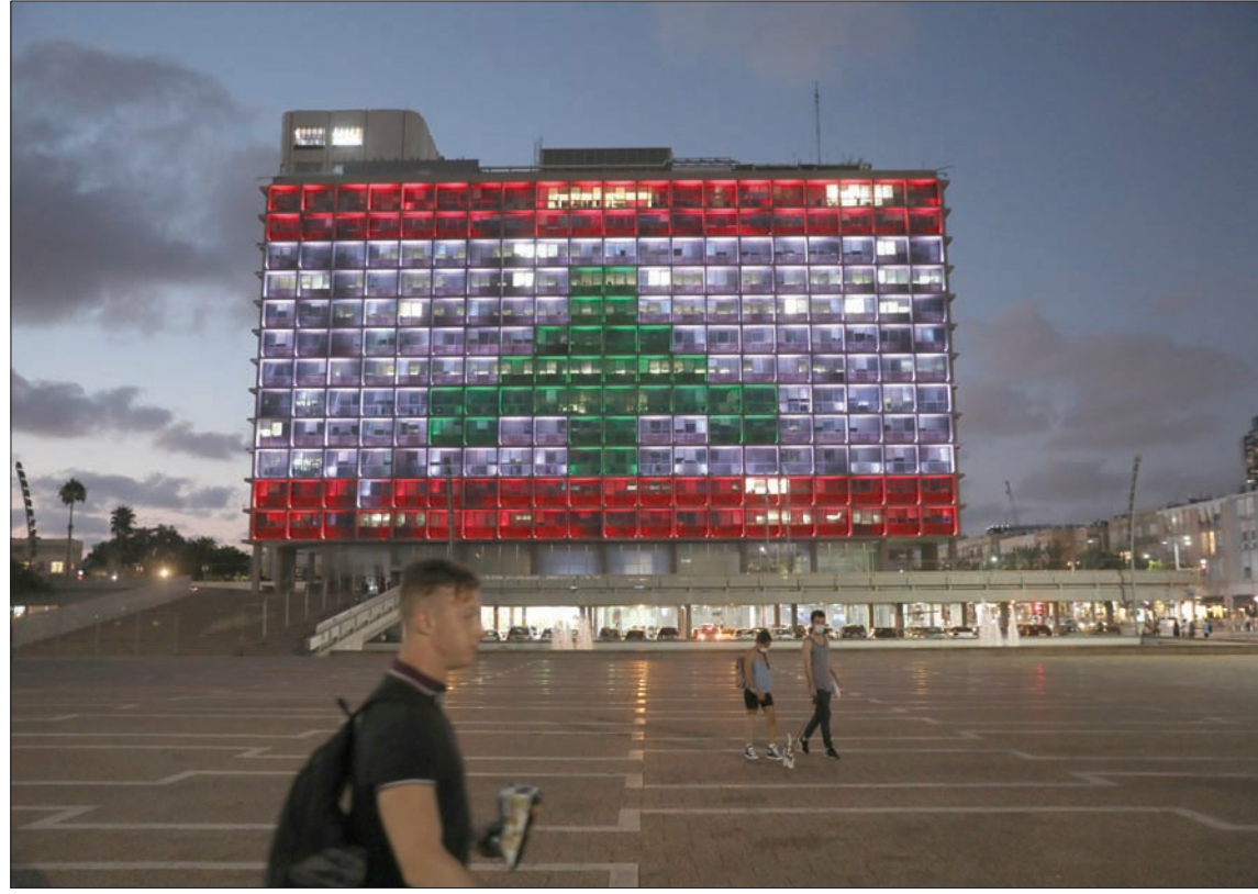
إضاءة مبنى بلدية تل أبيب بالعلم اللبناني