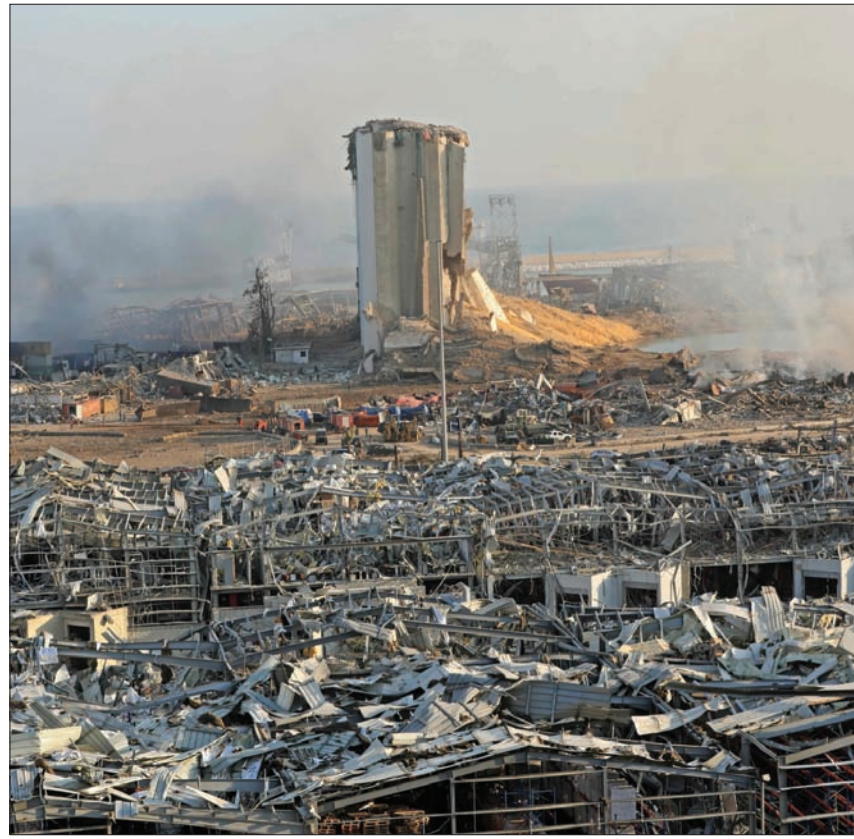
آثار الدمار في مرفأ بيروت والمناطق المحيطة به بفعل الانفجار

تحدثوا عن بيروت في الإعلام، من خلال معرفتهم الطويلة بها. بعضهم أمضوا فيها أياماً كثيرة، عندما حاصروها عسكرياً واحتلوا أجزاء منها (1982) وعندما تسلوا إليها في عمليات استخبارية أو عمليات اغتيال لشخصيات بارزة المختارة والبيوت والعمارات تخفي لباس امرأة في أبريل (نيسان) 1973 وهو يقود عملية اختاروا لها اسم «ربيع الشباب في بيروت» لاغتيال القادة الفلسطينيين كمال عدوان وكمال ناصر وأبو يوسف النجار.