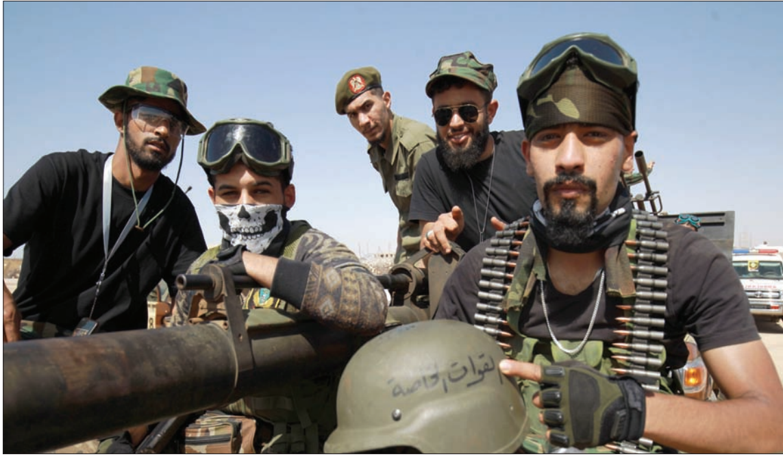
عناصر من القوات الخاصة التابعة للجيش الوطني في بنغازي

وسط معلومات عن اعترام الرئيس التركي رجب طيب أردوغان بزيارة العاصمة الليبية طرابلس، فتح «الجيش الوطني» بقيادة المشير خليفة حفتر، جبهة قتال ضد عناصر «تنظيم داعش» في جنوب البلاد، تزامناً مع تناقل وسائل إعلام محلية موالية لحكومة الوفاق برئاسة فائز السراج تقارير عن تحليق طائرات «درون» أميركية في مهمة غير معلومة في ليبيا. وقالت مصادر في «حكومة الوفاق» إنها «تستعد لاستقبال أردوغان في زيارة رسمية خلال الفترة المقبلة»، لكنها امتنعت عن ذكر المزيد من التفاصيل، علماً بأن كبار مساعدي الرئيس التركي توافقوا على طرابلس في زيارات معلنة وأخرى سرية خلال الأسابيع القليلة الماضية. وكان فخر الدين الطون رئيس دائرة الاتصال في الرئاسة التركية، اعتبر في تغريدة له على «تويتر» أن وجود فريق القائد البحري العماني تورغوت رئيس في طرابلس، رمزاً للصداقة بين شعبي البلدين.