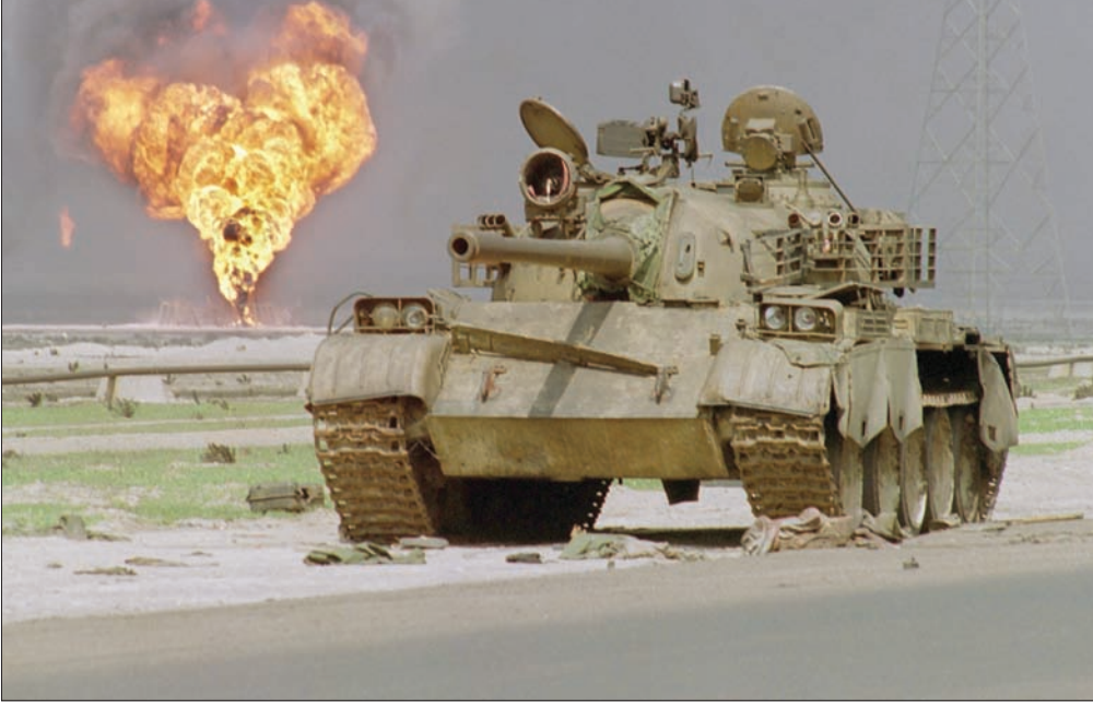
دبابة تابعة للجيش العراقي متروكة بعد انسحاب القوات العراقية من الكويت عام 1991

على عدم تغيير الحدود بالقوة بين الدول، ومن يفعل ذلك فهو مخترق للقانون الدولي؛ إنها فترة غريبة حزينة، والعودة إليها لا من أجل تضميم الجراح، بل موقف الإدارة الأردنية وقتها خاطئاً ومعتمداً على تمنيات، وجزء منها اعتقاد خاطئ (لهضم ما يتصور من حقوق)، وبه الكثير من التشفي؛ المؤسف الإصرار حتى اليوم على تبرير الخطأ وقتها يصبح خطيئة.