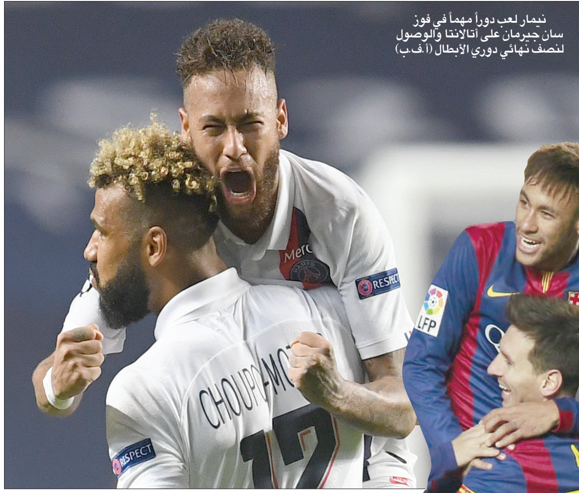
نيمار لعب دوراً مهماً في فوز سان جيرمان على أتلانتا والوصول لنصف نهائي دوري الأبطال

الألة التجارية الخاصة به وصولاً إلى قراره بأن يقضي أفضل سنوات مسيرته الكروية في «البريق الزائف» لباريس سان جيرمان الفرنسي، إن جاز التعبير.