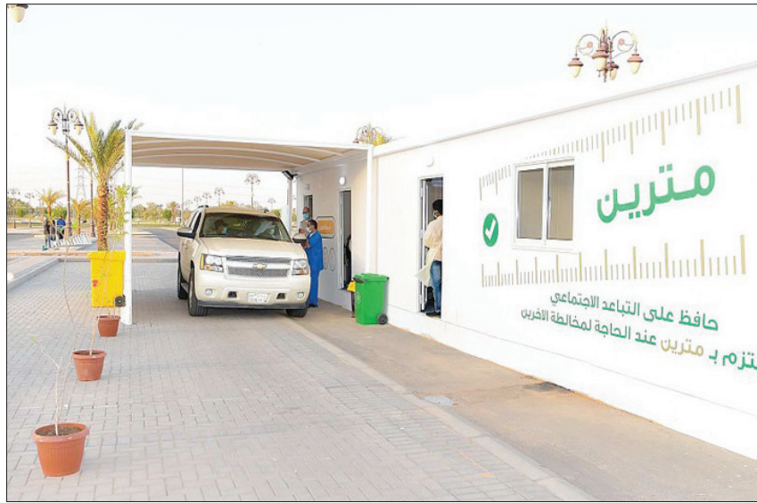
مركز لفحص «كورونا» في تبوك شمال السعودية (واس)

وقالت وزارة الصحة إنها سجلت أمس 508 إصابات جديدة بمرض «كورونا المستجد» خلال الـ 24 ساعة الماضية، ليرتفع بذلك الإجمالي إلى 76205 حالات، في