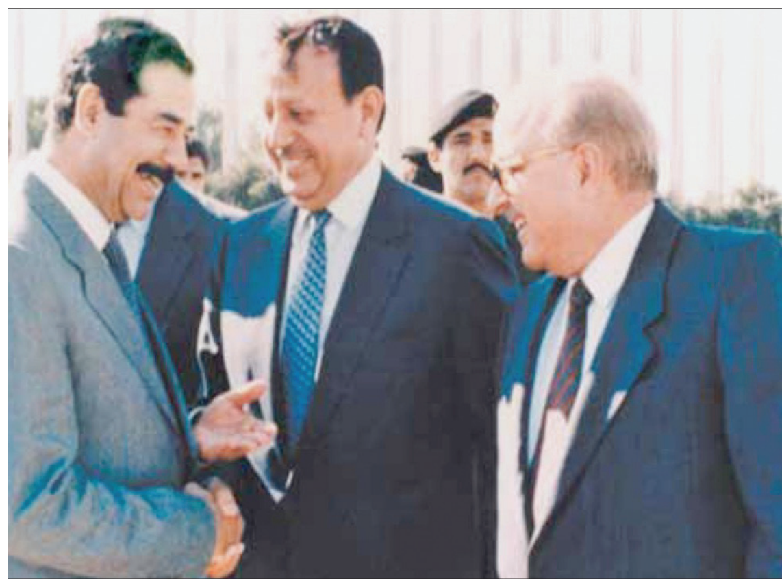
الرئيس العراقي السابق صدام حسين والأمير الأردني زيد بن شاعر... وعلى اليمين مضر بدران خلال استقبال رسمي

ذهبتا ونحن لا نعلم شيئاً عن الطريق، ولا نعلم طبيعة ظروفها، ولا نعلم عن المدة الزمنية التي ستستغرقها الرحلة. انطلقت صوب العراق ولم أخبر أحداً من أسرتي، بذانا السير على الطريق، وبالكاد ترى أحداً عليه، والمشكلة تكمن بسهولة استهداف المركبتين؛ لأنهما تسيران بسرعة عالية ويمكن رصدهما، كان الهدف من الخروج بمركبتين هو إن تعملت إحداهما، تبقى الأخرى تعمل. وسرنا على الطريق الدولية بالسيارات المصفحة، على سرعة 200 كم بالساعة، وكانت مجازفة خطيرة؛ لأن أي