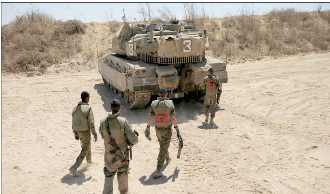
جنود إسرائيليون وديابة قرب حدود قطاع غزة أمس

التي أبرمتها إيران مع دول الخليج العربي، والتي تعيد الاتصال بين دولة الإمارات وإسرائيل، وأنهما «أكدتا الالتزام بتحقيق بنود معاهدة السلام بين الدولتين من أجل النهوض بالسلام والتنمية الإقليمية». وأفادت وكالة الصحافة الفرنسية أن «اتفاق تطبيع العلاقات الذي أعلنه الرئيس الأمريكي دونالد ترمب الخميس هو الثالث من نوعه الذي تبرمه إسرائيل