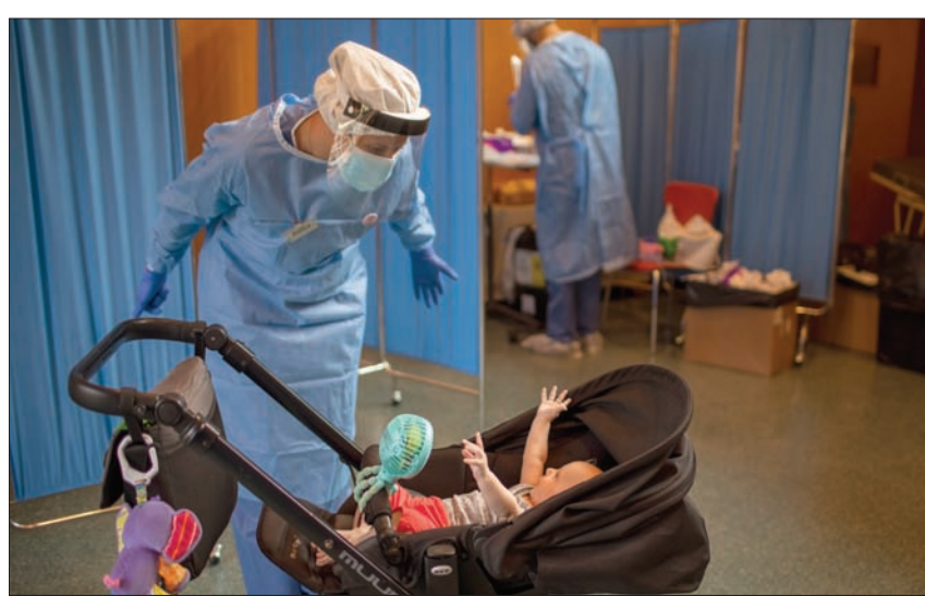
متطوعة تلاعب طفلاً بينما يخضع والده لفحص «كورونا» في مدينة فيلا فرنسا خارج برشلونة

يقول أمدج الخولي، استشاري الوبائيات بمنظمة الصحة العالمية، لشبكة «الشرق الأوسط»، «ارتفاع عدد الحالات هو أحد السيناريوهات المتوقعة اعتماداً على خبرتنا من الجائحة والتفشيات الوبائية السابقة، وقد يكون الوضع أكثر ضراوة من التفشي السابق إذا