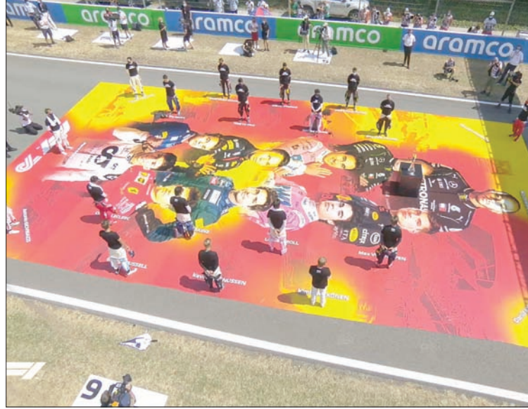
صور أبرز المشاركين في السباق على أرض الحلبة أمس