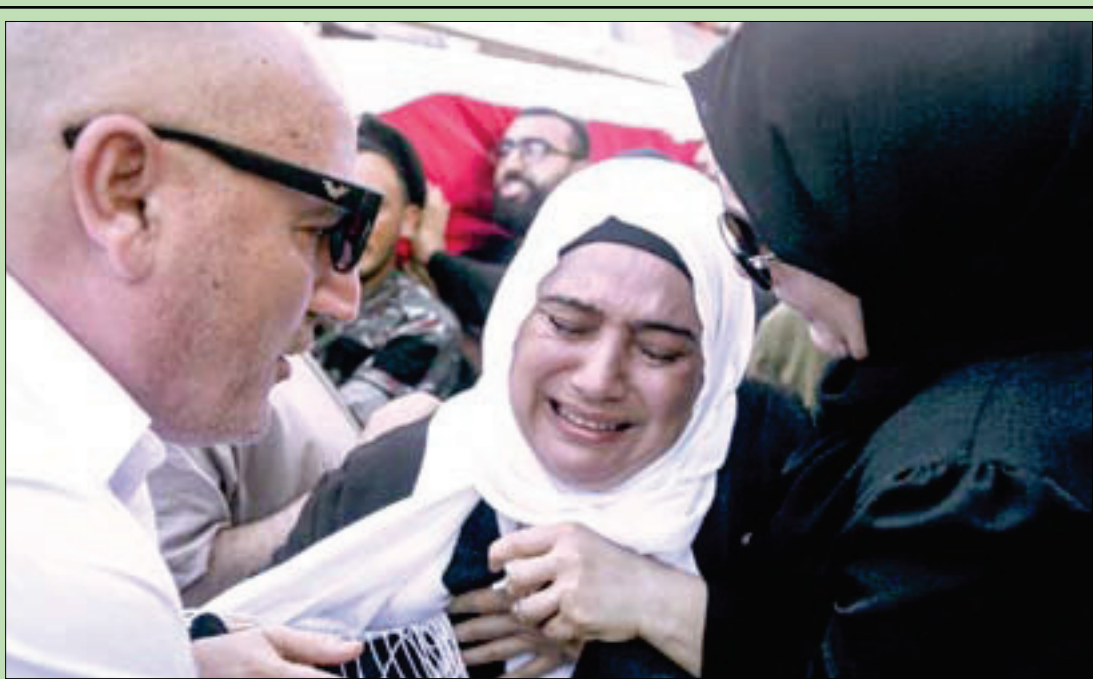
والدة إطفائي قُتل في انفجار مرفأ بيروت تبكي خلال جنازته أمس