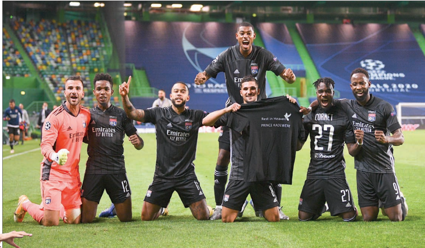
لاعبو ليون يحتفلون بالانتصار على سيتي والتأهل لنصف النهائي

ويعد أن حقق لقب دوري الأبطال في مناسبتين