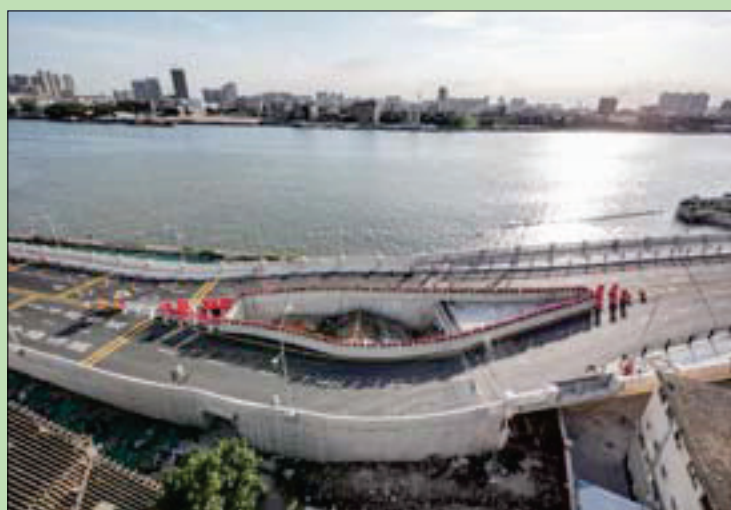
البيت الذي رفضت صاحبه مغادرته بين حارتين من الطريق السريعة بمدينة غوانغزو الصينية

استخدام المصطلح للإشارة إلى المواطنين الذين يرفضون التخلي عن منازلهم من أجل مشاريع البنية التحتية الكبرى. وتضطر شركات البناء حين ذاك إلى بناء الجسور والطرق السريعة وحتى مشاريع التنمية الأخرى حول هذه المنازل.