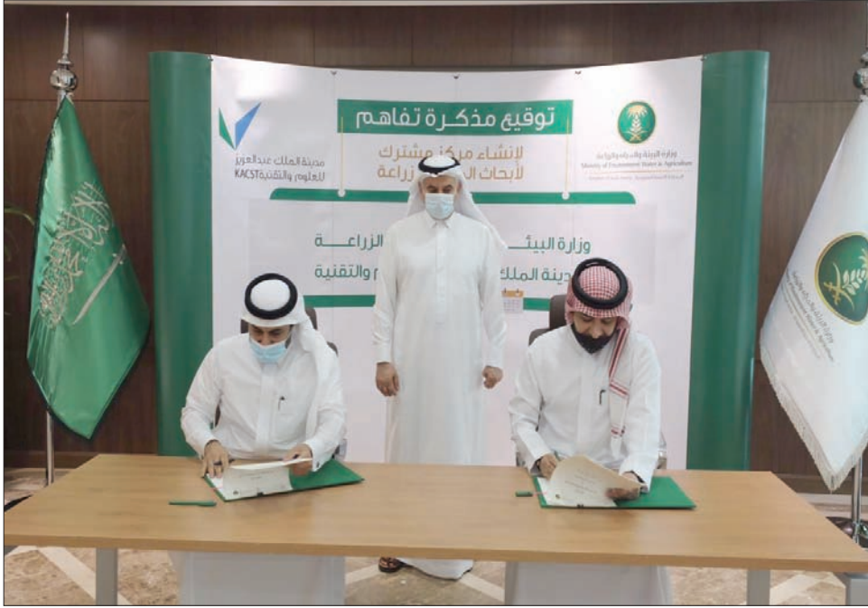
إبرام اتفاقية حكومية في السعودية لإنشاء مركز ابتكار تقني في أبحاث المياه (الشرق الأوسط)

ولفتت إلى أنه سيتم تطبيق أحكام النظام على جميع مصادر وشؤون المياه في المملكة بما فيها المناطق الخاصة فيما عدا مياه زمزم، مضيفاً أن الوزارة تتولى تنفيذها بالتعاون مع إمدادات المياه، وإعداداتها، واستخداماتها، ومعالجتها (على المدى القصير والمتوسط والبعيد)، وإعداد الخطط طويلة المدى للمياه، بالإضافة إلى إعداد خطط ومعايير الخزن الاستراتيجية للمياه.