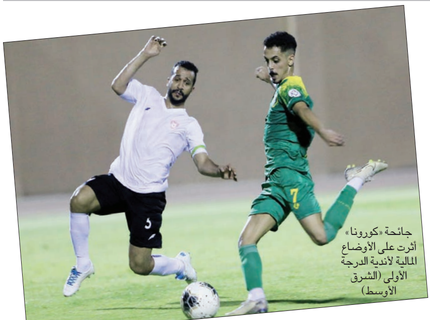
جانحة «كورونا» أثرت على الأوضاع المالية لأندية الدرجة الأولى

الرياض، «الشرق الأوسط» ما زال منافسا على تحقيق لقب الدوري رغم صعوبة مهمته في ظل اتساع الفارق النقطة بينه وبين المتصدر إلى تسع نقاط، قضته على المركز الثاني بعد مزاحمة من فريق الأهلي الذي تعثر في هذه الجولة أمام فريق الفيصلي، ورفع النصر رصيده بفوزه على الوحدة في ختام منافسات هذا الأسبوع إلى النقطة 51 ويفارق ثمانية نقاط عن أقرب منافسيه فريق الأهلي. وحقق الفريق الأصفر فوزاً صعباً على ضيفه فريق الوحدة بهدف وحيد حمل توقيع ليعبي وهدف الفرسكي المغربي عبد الرزاق حمد الله، ليبقى بطل