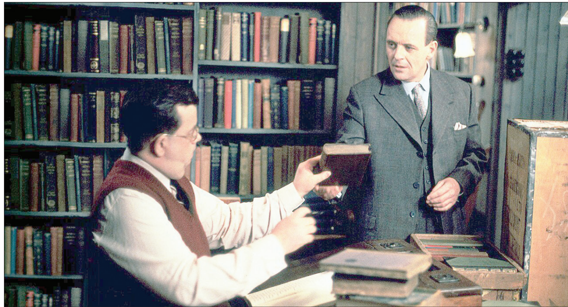
لقطة من الفيلم البريطاني - الأميركي «شارع تيشرينغ كروس 84» إخراج ديفيد جونز عام 1987 بطولة أنتوني هوبكنز وأن بانكروفت

عزت القمحاوي منذ القدم، كان الوعي بأن متلقي الأدب ليس صفحة بيضاء تستقبل النص، نجد ذلك الوعي عند العرب من عصر ما قبل الإسلام، كما نجد عند فلاسفة اليونان، وعلى الشراكة بين الكاتب والقارئ يقوم عمل مؤسس علم البلاغة عبد القاهر الجرجاني؛ حيث يعتبر الزينة والفضل للكتاب إذا احتل وجهه آخر غير الوجه الظاهر الذي جاء عليه. ويدون شيفرة بين القارئ والكاتب بقفوض كل عمل الجرجاني.