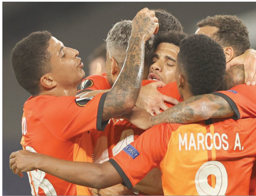
برازيليو شاختر يحتفلون بالفوز على بازل وهم أهل الفريق في تجاوز إنتر

في المقابل، يتطلع شاختر للفائز بلقب البطولة باسمها القديم (كأس الاتحاد الأوروبي) عام 2009 لاجتياز عقبة إنتر الذي توج أيضاً بلقب «كأس الاتحاد الأوروبي» أعوام 1991 و1994 و1998.