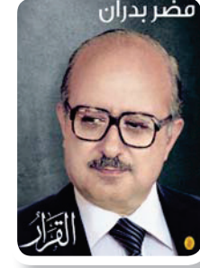
مذكرات رئيس الوزراء الأردني الأسبق

في هذه الحلقة الثانية من مذكرات رئيس الوزراء الأردني السابق مضر بدران التي تنشرها «الشرق الأوسط»، يروي تفاصيل عن استعدادات الأردن لمواجهة آثار الغزو العراقي للكويت على الأردن، ومنها