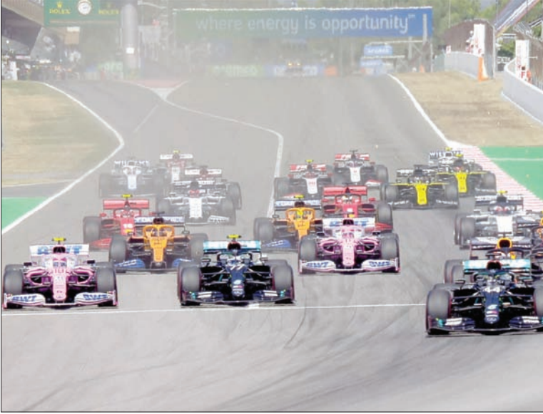
جانب من سباق «جائزة أرامكو - إسبانيا فورمولا 1»