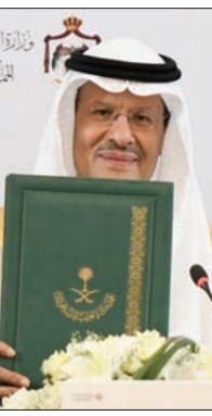
وزير الطاقة السعودي