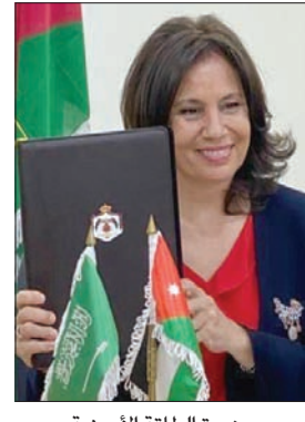
وزيرة الطاقة الأردنية