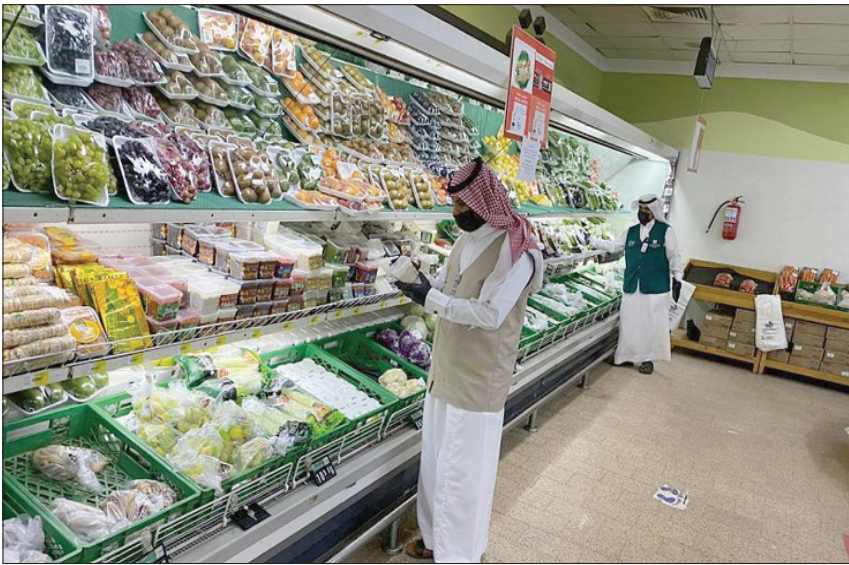
أمانة نجران تغذ جولات رقابية على المحال المتعلقة أنشطتها بالصحة العامة

أما وزارة الصحة العامة القطرية، فقد سجلت أمس حالة وفاة واحدة، إضافة إلى 271 إصابة جديدة بفيروس «كوفيد -19»، وقالت الوزارة، في بيان، إن الحصيلة الإجمالية للجانحة ارتفعت بذلك إلى 193 حالة وفاة و115080 إصابة بالفيروس الناتج.