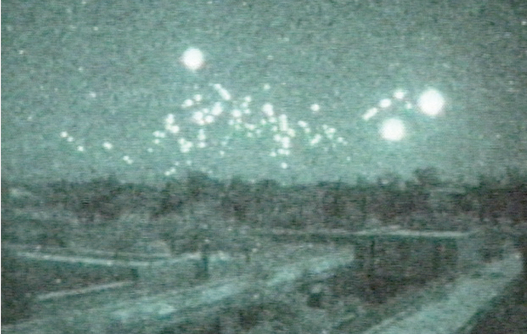
لقطة من كاميرا فيديو لمصادات طائرات عراقية في بغداد خلال حرب الخليج

استغرب من الأمر، فكيف لم يحسب الجيش العراقي حساب جنوده بالطعام اللازم خلال ما يتعرّضون له من حرب؟ تابعنا المسير بسرعة عالية إلى أن وصلنا بغداد، وتوقفنا عند سفارتنا، وإذ بها مغلقة، سالت عن الموظفين في السفارة، فأبلغني الحارس أنهم خرجوا للغداء، وأتصل بهم ليعودوا. سالتهم: «كيف تغلقون السفارة؟»، فاجابوا بأنهم لم يتخلغوا بزيارتي لبغداد، كما أنهم إن لم يخرجوا للغداء في تلك الساعة، فستغلق المطاعم والمحال، ويكثون في عملهم من دون طعام، وأبلغوني أن لا طعام لديهم سوى الجرجل، فالخبز والطحن مقطوعان في بغداد. طلبت منهم الاتصال بطارق عزيز وطه ياسين رمضان، ويبلغهما أنني موجود في بغداد وأريد لقاءهما.