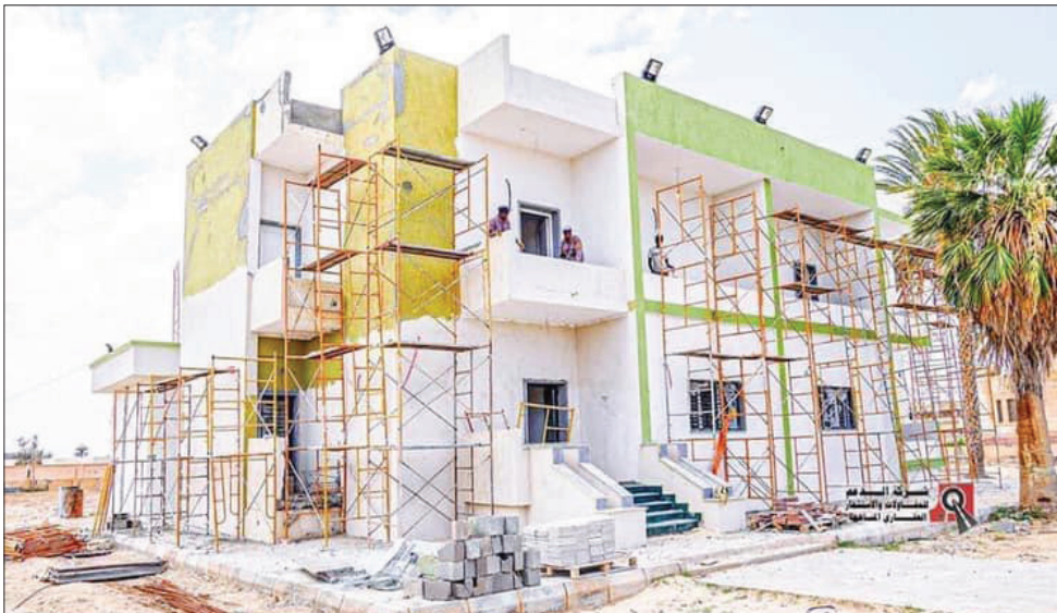
جانب من صيانة وتجهيز مقر للحجر الصحي في تاورغاء،