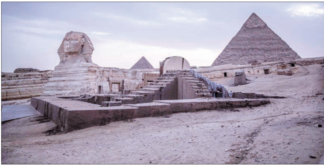
أثارت تغريدة إيلون ماسك عن بناء الأهرام جدلاً في مصر

«بعض زمن التأثير». وإذا كانت مثالب بعض تلك التدوينات تلقى بظلالها على جمهور مجتمع «السوشيال ميديا» في صور الإرباك وغيرها؛ فإنها في انعكاساتها المهنية الإعلامية، باتت حالة جديدة