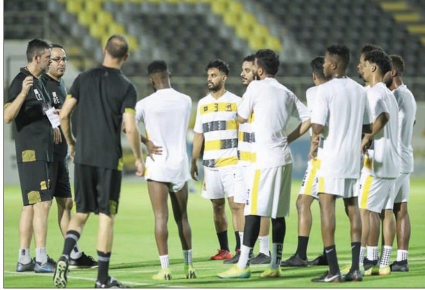
لاعب الاتحاد يستمعون لتوجيهات الجهاز الفني