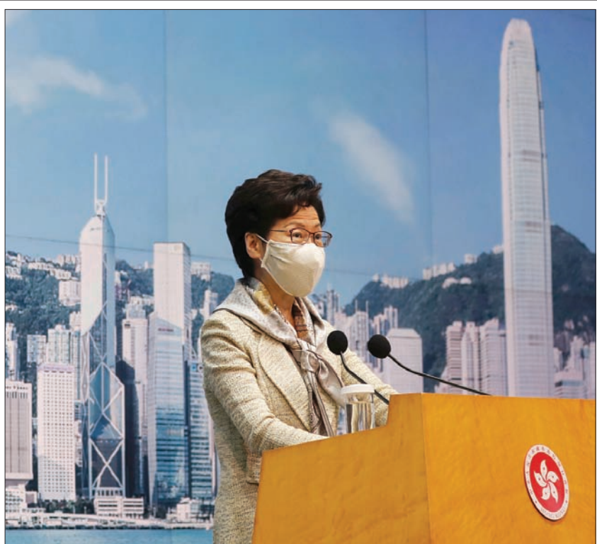
كاري لام الرئيسة التنفيذية لهونغ كونغ خلال مؤتمر صحفي سابق

كما أعلنت بكين في يونيو (حزيران) أنها تفرض قانوناً جديداً للأمن القومي في هونغ كونغ، لمنح وكالات الأمن سلطات موسعة لقمع المعارضة، ومنذ ذلك الحين، ناقش المسؤولون الأميركيون كيفية دفع بكين إلى التراجع عن القانون، أو كيفية معاقبتها بسبب ذلك الفعل. وفي الشهر الماضي، أمضى ترمب أمراً تنفيذياً ينهي الوضع الخاص الذي منحتة الولايات المتحدة لهونغ كونغ، في العلاقات الدبلوماسية والتجارية، قائلاً إن هونغ كونغ لم تعد كياناً مستقلاً عن الصين، وبدأ المسؤولون في معاملة الإقليم مثل الصين.