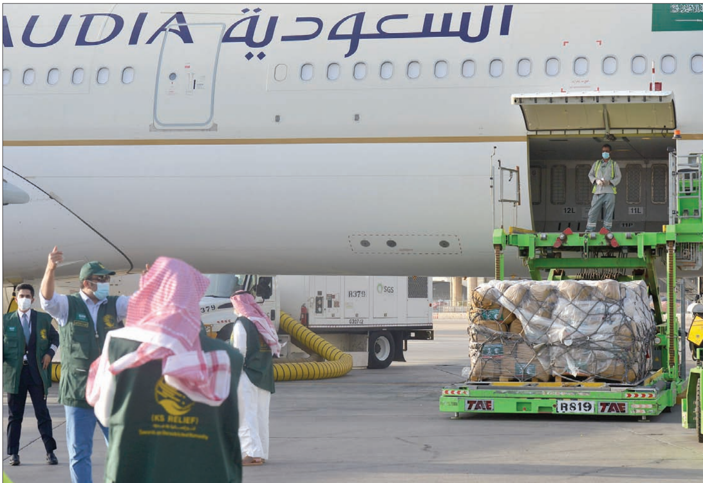
إحدى الطائرات السعودية التي نقلت المساعدات في مطار بيروت

ومن جهتها، قررت اليابان توفير إغاثة عاجلة للبنان، تتضمن خياماً وأسرة نوم ويطانيات وغيرها. عبر الوكالة اليابانية للتعاون الدولي (جايجا)، استجابة للأضرار الجسيمة التي تسبب بها انفجار بيروت. إلى ذلك، أرسلت الجزائر أربع طائرات إغاثة من الحجم الكبير، محملة بأكثر من 200 طن من المواد الغذائية والطبية والصيدلانية، وخيم وأغطية، يرافقها طاقم من الأطباء والجراحين وفرق الحماية المدنية (الدفاع المدني) يضم 50 شخصاً.