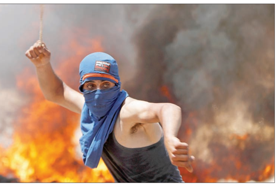
فلسطيني يشارك في احتجاجات ضد الاستيطان الإسرائيلي قرب رام الله أمس

وفي مرحلة ما أطلقوا الرصاص بشكل جنوني، وكشف أنهم أطلقوا النار على سيارة إسعاف تابعة لمركز إسعاف جنين بشكل مباشر، حيث اخترقت رصاصتان السيارة، وذلك لدى محاولتي تقديم الإسعاف الأولية للمصابة، وهي في لحظات حرجة كانت بحاجة فيها لكل حيلة في تلقي العلاج.