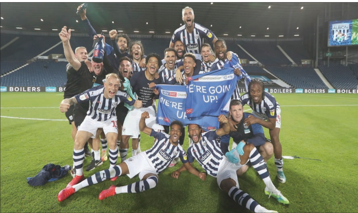
لاعب وست بروميتش يحتفلون بالصعود المباشر إلى الدوري الإنجليزي الممتاز

قليل أن يقرر الإبتعاد عن متابعة كرة القدم في نهاية المطاف، لكن بغض النظر عن كل ذلك، ظلت أفكار في كلمة «أحمق» التي قالها في رسالته. وبعد 46 عاماً من عشقي لكرة القدم ولل فريق الذي أشجعه، أدركت كلمة «أحمق» هي الكلمة المناسبة تماماً للحالة التي كنت عليها، لأنني كنت أبدو أحمق، سواء فاز فريقي أو خسر. ليس من الحمارة أن تشجع فريقاً لكرة القدم، لكن من الحمارة أن تصل لهذه الدرجة من الجنون أو «الاندماج»، كما يقول علماء النفس. إنه شيء من الحمارة والعار إلى حد ما.