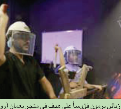
زبائن يرمون فؤوساً على هدف في متجر بعمان

لندن: «الشرق الأوسط» لجا الأردنيون إلى وسيلة جديدة للتنفيس عن غضبهم بعد جائحة «كورونا»، بإلقاء الفؤوس على أهداف وضعت أمامهم في متجر بالعاصمة عمان. توفّر غرف التنفيس عن الغضب التي يطلقون عليها «أكس ريج رومز»، في عمان، للأردنيين سبلاً مبتدعة لتفريغ شحنات غضبهم، بما في ذلك تدمير أجهزة التلفزيون ورمي الأطباق على الحائط. أما عن