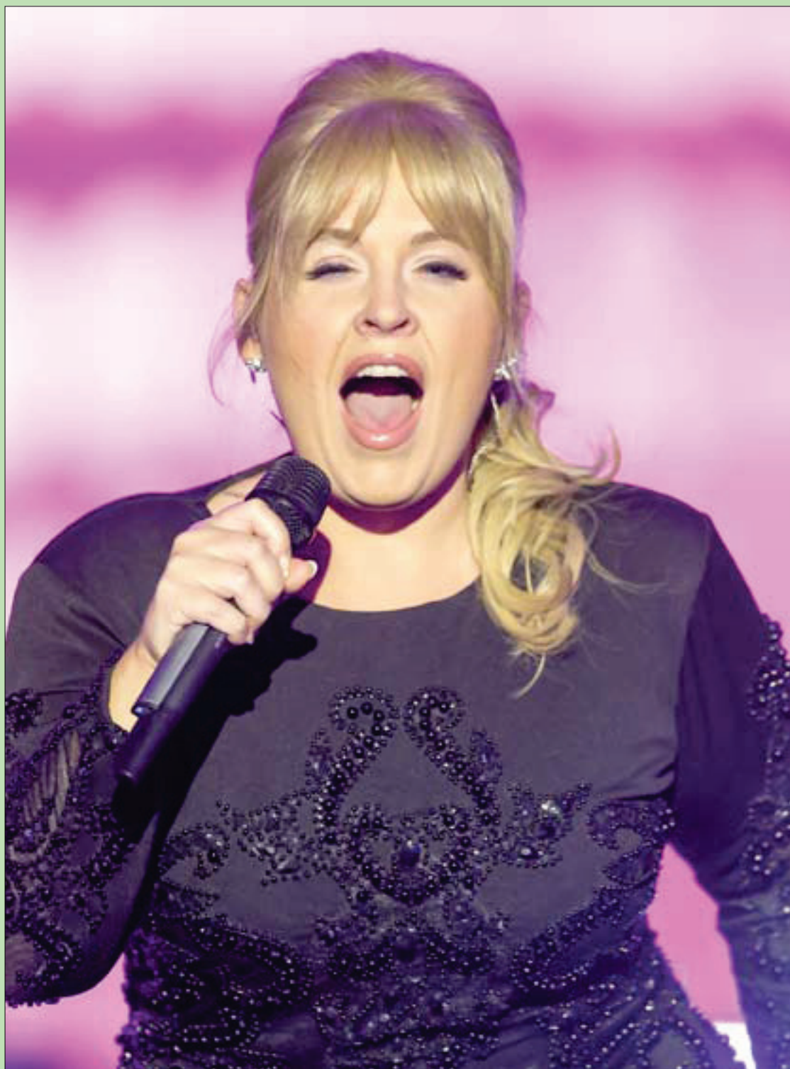
المطربة الأيرلندية مايتي كيلبي تغني خلال عرض «رولان كايزر» بعنوان «الحب يمكن أن ينقذنا»

وعندما خرج المصلون، لم يجدوا حتى حذاءً واحداً، واضطروا مرغمين أن يخوضوا وسط أحوال الثلوج حفاة. لا أدري: هل أوجه الشتمة لذلك اللص أم أشد على يده؟!