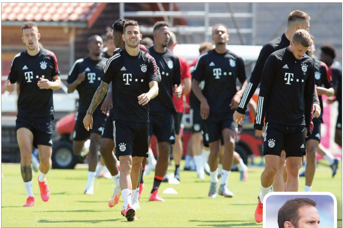
بايرن ميونخ مرشح للتأهل لربع نهائي دوري الأبطال على حساب تشيلسي

أشار «إلى أنه يريد القيام بشيء جديد»، ولكن حتى الآن لم يقدم أي ثاب عرضاً للشاب البالغ من العمر 29 عاماً، رغم أن تقارير عدة ربطت اسم الإسباني ببطل الدوري الإنجليزي لليفربول. ومنذ انضمامه من برشلونه عام 2013، يطلب من المدرب السابق للفريقين البافاري والكاتالوني الإسباني جوسيب غوارديولا، فاز الكانتارا بلقب الدوري الألماني في موسمه