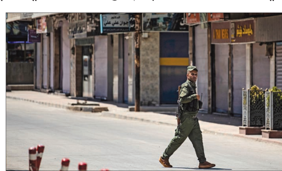
عنصر من «قوات سوريا الديمقراطية» في القامشلي شرق الفرات امس

ولفت خبراء إلى أن الولايات المتحدة تواصل الاستيلاء على الهيدروكربونات السورية. وهذه المرة، اتخذ ذلك بعداً واضحاً ومباشراً في خلال دخول الشركات الأمريكية في اتفاق مع القوات الكردية التي تسيطر على مناطق شرق الفرات لتحديث الحقول النفطية».