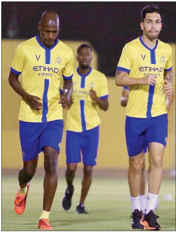
من تدريبات النصر تاهباً لمواجهة أبها