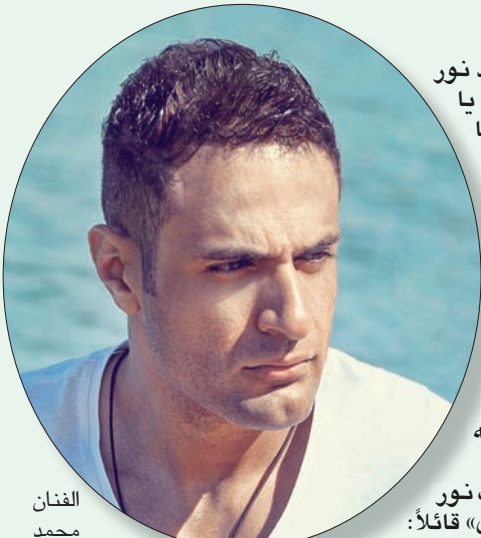
الفنان محمد نور

طرح الفنان محمد نور أغنيته الجديدة «مالك يا ترى»، التي يتعاون فيها مع الفنان أحمد السقا، الذي يخوض عبرها تجربة كتابة الشعر لأول مرة، وكشف نور في حوار مع «الشرق الأوسط» عن تكرار التجربة مرة أخرى مع السقا خلال اليوم الجديد، الذي يجهزه حالياً، والمتوقع طرحه مع نهاية العام الحالي.