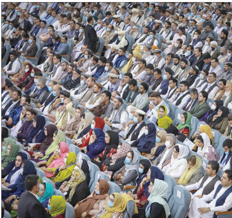
اجتماع مجلس «لوي جيرغا» في كابل للتشاور بشأن إطلاق سراح 400 سجين من «طالبان» (إب.أ)

سلام وإنهاء الحرب. وحث بومبيو الرئيس الأفغاني أشرف غني، والدكتور عبد الله عبد الله رئيس المجلس الأعلى للمصالحة الوطنية، والقادة الأفغان الآخرين، بمن فيهم المشاركون في «اللوي جيرغا»، على الاستفادة من هذه الفرصة التاريخية من أجل سلام بعيد جميع الأفغان، ويسهم في الاستقرار الإقليمي والأمن العالمي، مشدداً على أن التهديدات الإرهابية في أفغانستان يجب ألا تشكل مرة أخرى تهديداً للولايات المتحدة وحلفائها، قائلاً: «نحن على استعداد للحفاظ على مساعدة أمنية كبيرة لشركائنا في الأمن المفاوضين تحدثنا عن الهدف»، وأضاف: «في حين أن مستقبل أفغانستان يقرره الأفغان أنفسهم، فإننا ندعم بقوة الحفاظ على المكاسب الاجتماعية