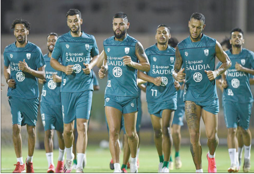
من استعدادات الأهلي لمواجهة الديربي (الشرق الأوسط)