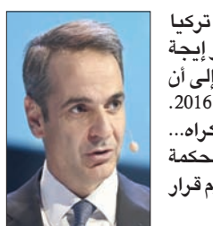
كيريلاكوس ميتسوتاكيس، رئيس الوزراء اليوناني

«لنا مسرور دائماً بالتعاون مع تركيا بشأن ترسيم المناطق البحرية في بحر إيجه وشرق المتوسط... لقد أحرزنا تقدماً إلى أن أنهت تركيا المباحثات التمهيدية في 2016. لن نأتي إلى طاولة المفاوضات بالإكراه... وفي حال وجود خلاف سنحتكم إلى محكمة العدل الدولية في لاهاي، وسنحترم قرار المحكمة».