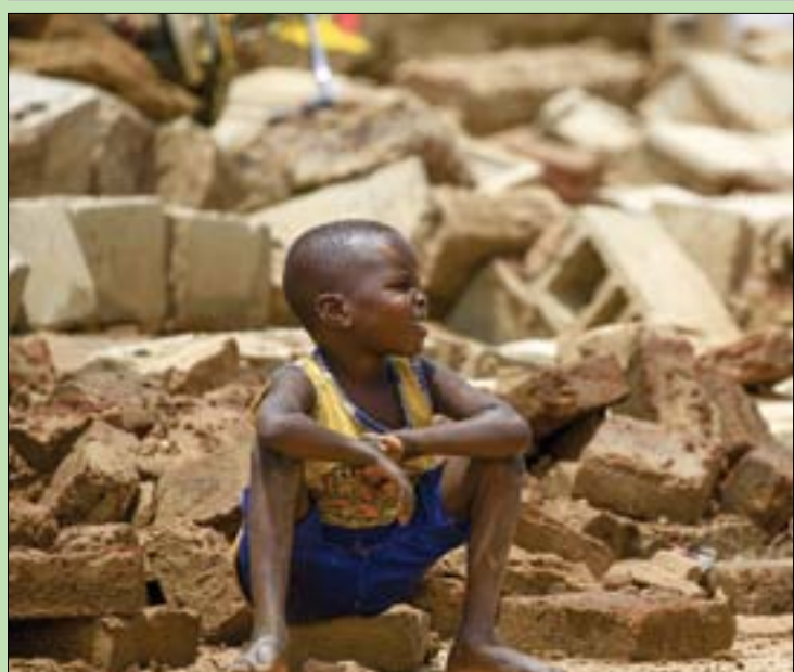
طفل يجلس على ركام أحد المنازل في بلدة جنوب شرقي الخرطوم

الماضي، تضرر أكثر من 25 ألفاً بتأثيرون بالأمطار الغزيرة في موسم الخريف، وتوقع أن تكون الأمطار فوق المعدل الطبيعي في معظم الولايات، ما قد يؤدي إلى فيضانات، ويتسبب في تدمير المنازل والبنية التحتية ووسائل العيش.