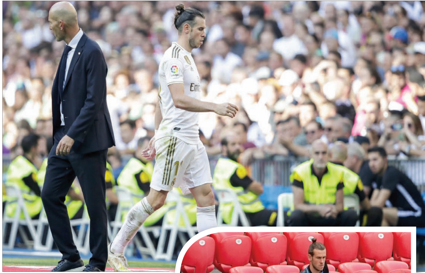
لم تكن هناك خلافات حادة بين زيدان وبيل لكن انكسر شيء ما ولم يتم إصلاحه حتى الآن

لم يكن زيدان يتوقع أن يُثار كل هذا الجدل واللاعب الأعلى في تاريخ النادي والأعلى أجراً في النادي لا يشارك في المباريات ويعامل كأنه لاعب منبؤ؟ ومن المثير للإعجاب أن هذه المشاكل لم تؤثر على مسيرة النادي، الذي نجح في الحصول على لقب الدوري الإسباني الممتاز في نهاية المطاف. لكن الحقيقة الواضحة للجميع الآن تتمثل في أن بيل لم يعد جزءاً من الفريق. وحتى لو لم تكن هناك علاقة كراهية بين اللاعب والنادي، فمن الواضح أنه لم تعد هناك علاقة تجمع الطرفين من