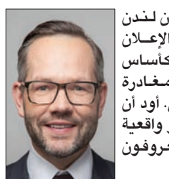
ميكال روت، وزير الشؤون الأوروبية الألماني