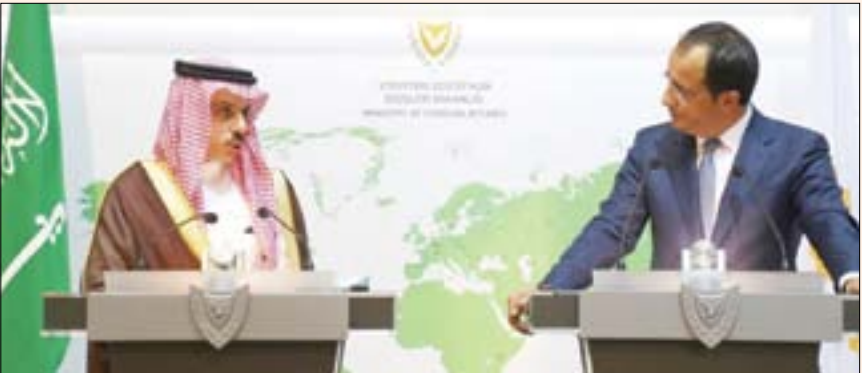
فيصل بن فرحان خلال لقائه وزير خارجية قبرص

العاصمة نيقوسيا، وقال بيان صحافي صدر هذه المناسبة، إن اللقاء، شهد توافقاً حيا ل العديد من الموضوعات.