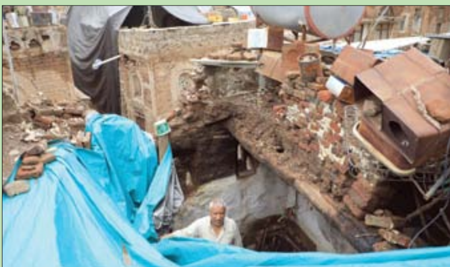
الأضرار طالت عدداً كبيراً من المنازل في صنعاء

وشملت المساعدات المقدمة من قبل الوكالات الأممية توزيع مواد إيوائية و مواد غير غذائية لعدد 53 أسرة نازحة ومتضررة من مديرية بني قيس في محافظة حجة بالتزامن مع بدء في التدخل الإنساني لتغطية الاحتياجات في مديرية عبس والمواقع المتضررة في مديرية أسلم، وبين فتح أن مركز الملك سلمان للإغاثة والأعمال الإنسانية يبادر منذ اليوم الأول لأثار الناتجة عن الأمطار والسيول من المحافظات بتوزيع المساعدات الإنسانية العاجلة في محافظات مارب وحجة والحديدة، وتم التنسيق بين المركز ومنظمات الأمم المتحدة لتقديم الدعم العاجل للمتضررين في محافظات الحديدة وعمران ومارب وأبين والضالع وحجة والمحويت).