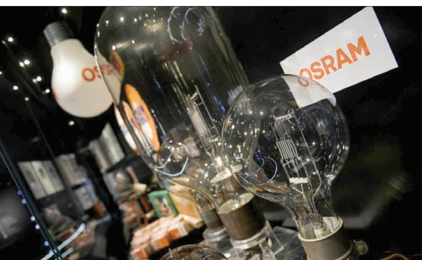
حقق الإنتاج الصناعي الألماني نمواً شهرياً في يونيو لكن قيمة الصادرات تراجعت

وفي الشهر الماضي، ذكرت في 63 في المائة من الشركات الألمانية في الخارج أنها تضررت بقيود السفر. وقال فانسليين إن النسبة في الولايات المتحدة تصل إلى 69 في المائة، موضحة أن «هذه الأرقام مقلقة بشكل خاص، لأنه مع الصادرات التي بلغت قيمتها ما يقرب من 119 مليار يورو في عام 2019، أصبحت الولايات المتحدة أهم سوق تصدير لألمانيا. بالإضافة إلى ذلك، تعد الولايات المتحدة من أهم مواقع الاستثمار».