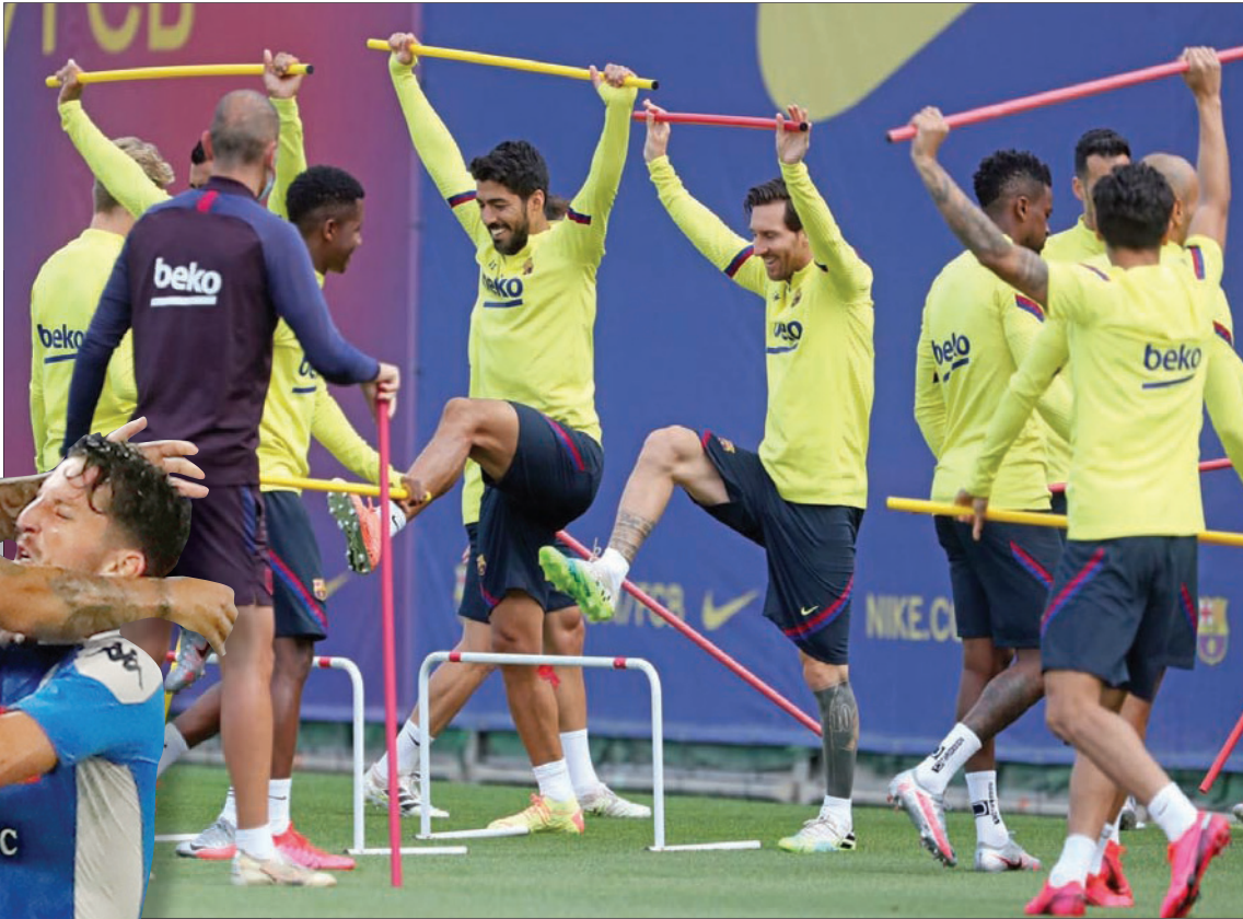
برشلونة يتطلع لتعويض خسارته المحلية بفوز على نابولي اليوم

وكانت الشجارات الأخيرة أمام روما الإيطالي، وليفربول الإنجليزي، كارثية في الأندية الإقصائية، وقد بررها لاعبو برشلونه بالتعرض لضغوط نفسية كشفت الفريق منذ الوقت. وقال المدرب المقال من منصبه إرنستو فاليريدي، بعد