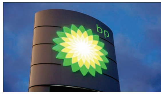
تستعد «بي بي» للتخلص من جزء كبير من أصولها للنفط والغاز حتى إذا انتعشت أسعار الخام

شركة الطاقة البريطانية فور بيعها أصول النفط والغاز التي توفض بأنها عالقة. ولم ترد «بي بي» على طلبات للتعليق، وتلقى الاستراتيجية