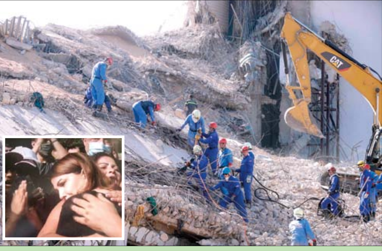
فريق إنقاذ روسي يبحث عن ناجين في ركاب مرفأ بيروت أمس (أ.ف.ب)... وفي الإطار المطربة ماجدة الرومي وهي تواسي أقارب ضحايا