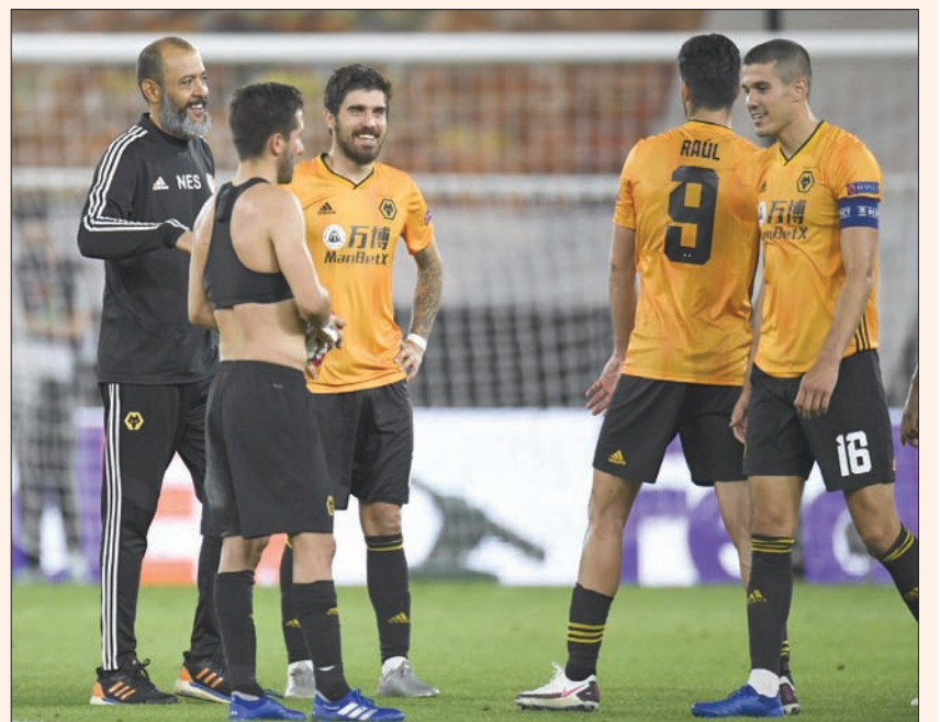
لاعب وولفرهامبتون ومدربهم بعد التأهل لدور الثمانية