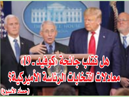
هل تغلب جائحة (كوفيد-19) معادلات انتخابات الرئاسة الأمريكية؟ (حماد الأسير)