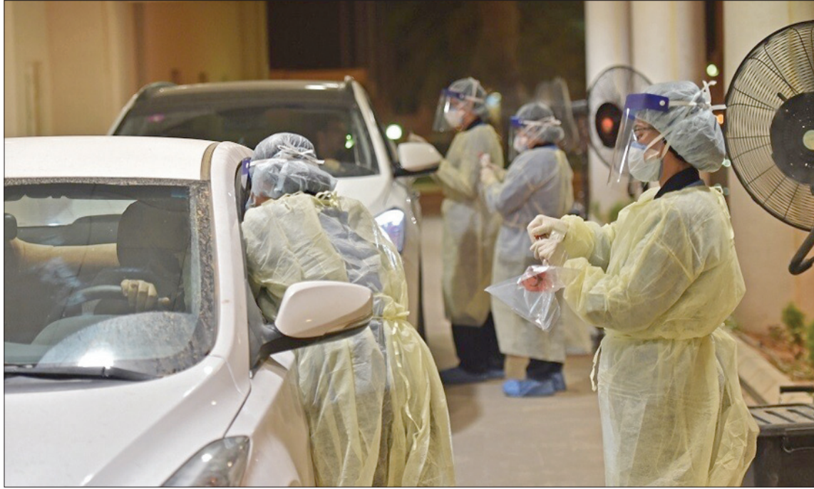
تكثيف الفحص النشط في جميع مدن السعودية (أ.ف.ب)

قطر من جهتها، أعلنت وزارة الصحة العامة تسجيل 291 حالة إصابة جديدة مؤكدة بفيروس، وشفاء 311 حالة في الـ24 ساعة الأخيرة، ليصل بذلك إجمالي عدد المتعافين من المرض في دولة قطر إلى 109142، بالإضافة إلى تسجيل حوالي وفاة جديدتين.