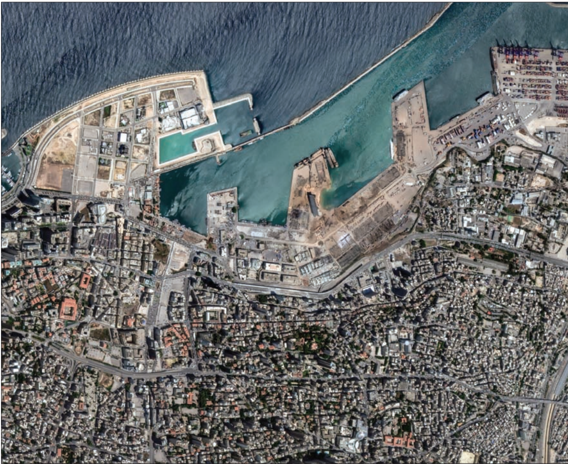
صورة من الجو تظهر حجم الدمار الذي لحق بمرفأ بيروت

وعادة تراجع احتمال التفجير بصاروخ أرض - جو، ينص التحقيق على فرضيتين أساسيتين: الأولى تذهب باتجاه تسرب الحرارة إلى المستودع، والأخرى لا تغفل العمل الإرهابي، ويبدو أن الفرضية الثانية تأخذ الحيز الأكبر من الاهتمام، واحتمال ربطها بتفجير متعدد، وشدد المصدر الأمني على «ضرورة التعقق بالتحقيق بمغزى تخزين مادة