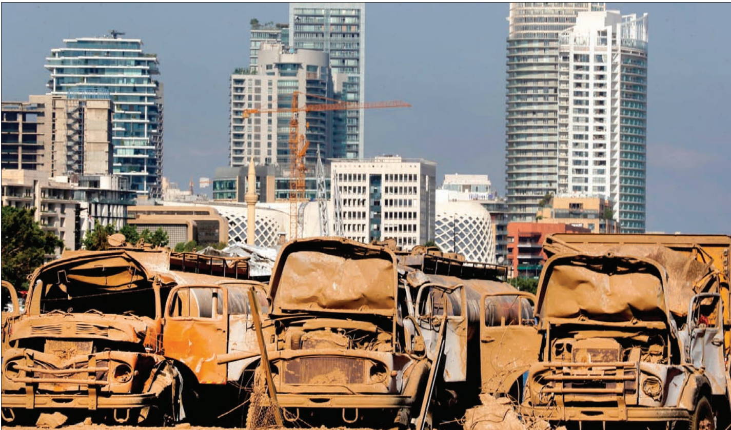
شاحنات محترقة في مرفأ بيروت

هذه المواد، أن تدبر نفسها أو تقوم هي بالتحقيق فيه، فذلك يترتب عليه تضارب في المصالح والمسؤوليات».