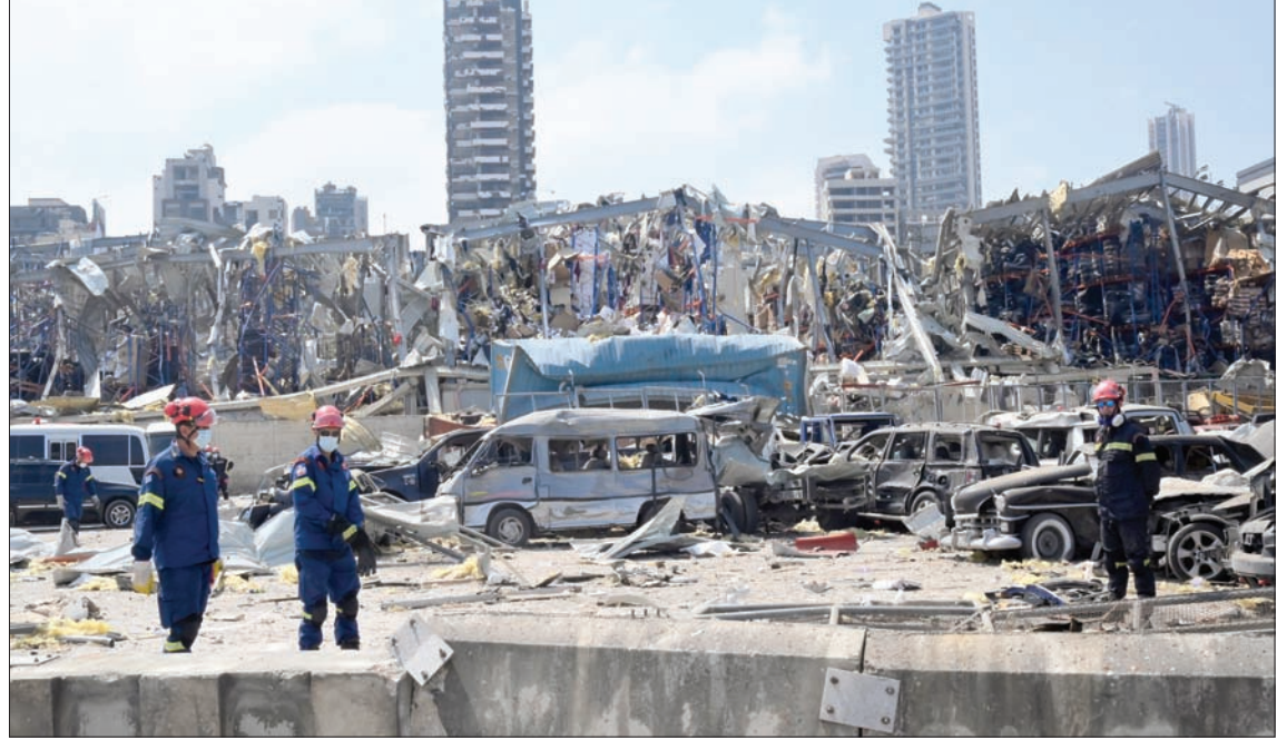
تتفق التقديرات الأولية للخسائر الناجمة عن انفجار مرفأ بيروت على تعديها عتبة 5 مليارات دولار

لكن مصادر معنوية في «البنك المركزي» أكدت له «الشرق الأوسط» أن فتح قناة التمويل بالدولار للمتضررين يهدف حصراً إلى مدهم بالسيولة الفورية لايءاء وإصلاح المنازل والمقرات المهتمة جزئياً أو كلياً. أما قنوات التعويضات وحصرياً وتقدراتها، فهي منوطه بالهيئة العليا للإغاثة وسائر المؤسسات الحكومية المعنية... والتعويض حق مشروع لكل متضرر، ويمكن