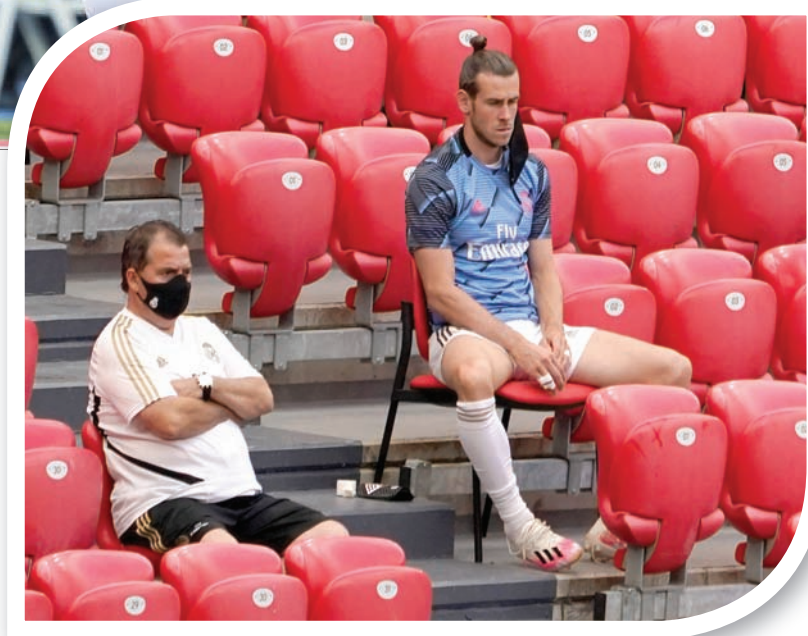
بيل على مقاعد البدلاء (رويتز)

ريال مدريد هذا الصيف؟ ربما كان المدير الفني الفرنسي يريد أن يرد بشكل حاسم ويقول: «نعم»، لكنه تراجع وقال: «يا له من سؤال يا رجل!» وقال زيدان إن بيل «واحد منا». لكن ما حدث في الليلة التالية يقول ريال مدريد على لقب الدوري، كان اللاعب الوليبي لا يشعر بالراحة أثناء الاحتفالات بالفوز باللقب. وبينما كان لاعب ريال مدريد يرفعون زيدان لأعلى احتفالاً بالحصول على درع الدوري، اتخفى اللاعب الوليبي بالوقوف بعيداً مكتوف اليدين. قد يكون بيل قد تعرض لانتقادات لأدائه بسبب عدم مشاركته في الاحتفالات، لكن تادية على هذه البطولة، ولذا لا يشعر بحلاوة الفوز بها. وبعد أقل من شهر من إعلان زيدان على أنه سيكون من الأفضل إذا رحل بيل عن