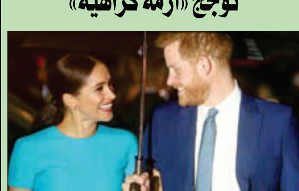
الأمير هاري وزوجته ميغان ماركل