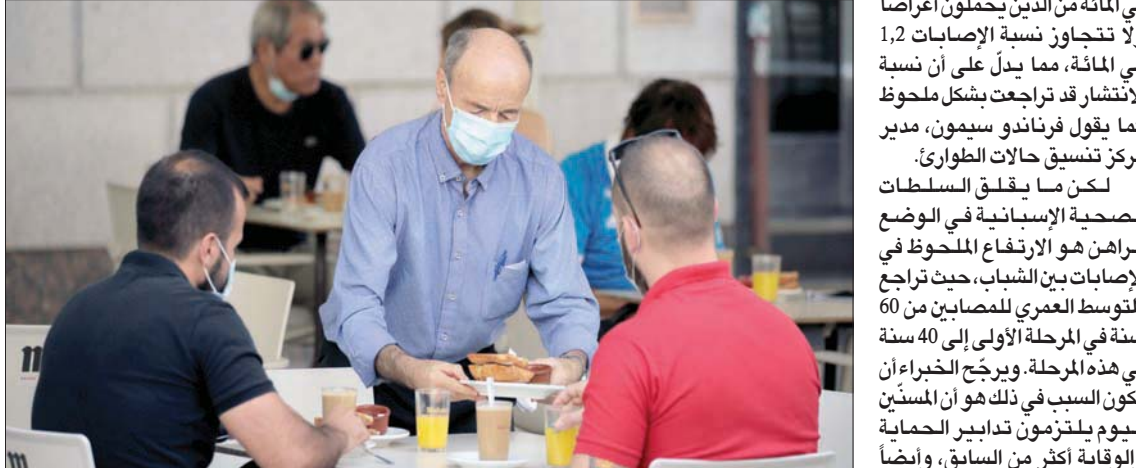
أصبح ارتداء الكمامات إلزامياً في كل الأماكن العامة بمدريد أمس

وما تثيره من تعقيدات قانونية. وترجع ظهور بؤر جديدة ومن جنيف، قالت منظمة الصحة العالمية إن «الوضع في إسبانيا يقتضي المراقبة والحذر، لكنه ليس خارج السيطرة». وأثنت على التدابير التي تتخذها السلطات المركزية والإقليمية، مشددة على أهمية الالتزام الصارم بجميع تدابير الاحتواء والوقاية، ودعت إلى تعزيز قدرات التعقب التي لا غنى عنها لمعرفة الوضع الحقيقي لانتشار الوباء. وفي جولة تقييمية للوباء بعد ستة أشهر من انتشاره، قالت مديرة قسم الصحة العامة والبيئة في المنظمة ماريا نيبرا: «من الواضح أن (كوفيد - 19) سيضمخ إلى قافلة الأمراض السارية التي لا بد من التعايش معها. لا بد من السيطرة عليه قدر الإمكان. وعن توقعاتها بشأن اللقاح، قالت نيبرا: «لا أعتقد أن اللقاح سيكون جاهزاً قبل أواسط العام المقبل لتوزيعه على نطاق واسع». لكن المهم هو أن تكون الدول واجهتها الصحية على استعداد لمواجهةها».