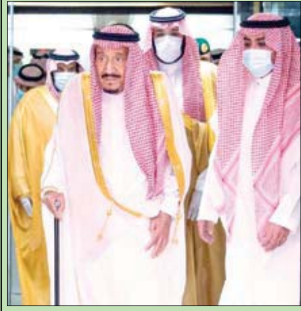
خادم الحرمين الشريفين لدى مغادرته أمس مستشفى الملك فيصل التخصصي بالرياض (واس)

الرياض، «الشرق الأوسط» غادر خادم الحرمين الشريفين الملك سلمان بن عبد العزيز، أمس، مستشفى الملك فيصل التخصصي بالرياض، بعد أن منّ الله - جل جلاله - عليه بالصحة والعافية، بحسب بيان للديوان الملكي نقلته «واس». ووجه الملك سلمان خالص شكره وامتنانه لابنائته وبناته من الشعب السعودي على مشاعرهم ودعواتهم الكريمة، معبراً عن تقديره لكل من اتصل هاتفياً أو سأل أو بعث بتمنياته له بالصحة والعافية من قادة الدول العربية والإسلامية والصديقة. وكان الملك سلمان دخل المستشفى في 20 يوليو (تموز) الحالي لإجراء فحوصات جراء التهاب في المرارة، وأجرى في وقت لاحق جراحة، تكللت بالنجاح.