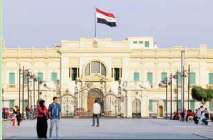
قصر عابدين وسط القاهرة (الشرق الأوسط)

يضمن تنظيم 40 حفلاً غنائياً ويستمر حتى شهر سبتمبر (أيلول) المقبل، ويشترك فيه كوكبة من كبار نجوم الموسيقى والغناء في مصر والوطن العربي، من بينهم الفنان محمد منير، والموسيقار الكبير عمر خيرت، والمطرب علي الحجار والفنان مدحت صالح، وأوركسترا القاهرة السمفوني، ورائد موسيقى الجاز يحيى خليل، بالإضافة إلى فرق أخرى على غرار «النفخة»، و«مسار اجباري»، و«فرقة أوبرا القاهرة».