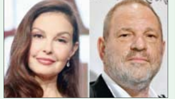
هارفي واينستين والمثلة آشلي جاد