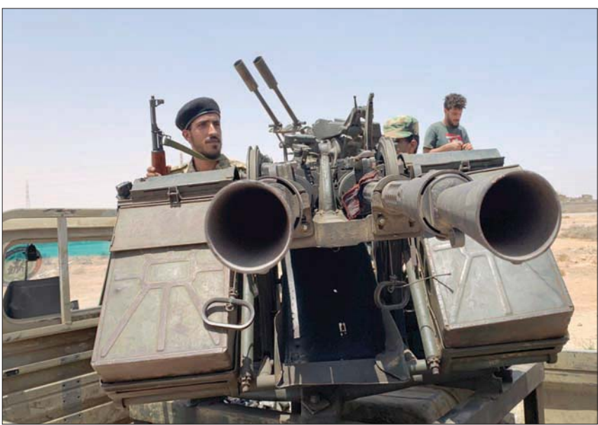
مولون لحكومة «الوفاق» في تدريب عسكري استعداداً لمعركة سرت

ونقل المصدر عن أبو الغيط تشديده على ضرورة إخراج كافة القوات الأجنبية من الأراضي الليبية، والتوصل إلى حل دائم وجذري للتهديد، الذي تتفله الميليشيات والجماعات المسلحة، مشيراً إلى أنه لا يمكن لأي مسار سياسي يهدف إلى التوصل إلى تسوية وطنية وخاتمة ومتكاملة للوضع الليبي أن ينجح، دون أن يتم وضع حد لهذه التدخلات الأجنبية، والاستهداف الإقليمي لأمن واستقرار هذا البلد العربي المهم.