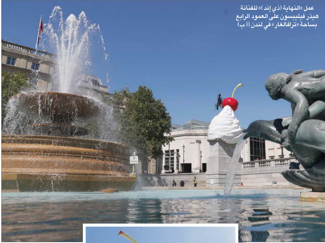
عمل «النهاية (ذي إند)» للفنانة هيلز فيليبسون على العمود الرابع بساحة «ترافالغار» في لندن (أ.ب)