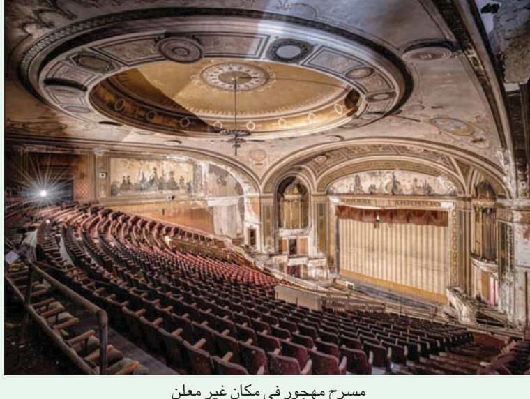
مسرح مهجور في مكان غير معن

ويبقى زملائه من القائلين على صناعة الكليم، الذين لا يتجاوز عددهم خمسة أشخاص، وكل واحد منهم لديه عدد من السيدات يقدم لهن الصوف، لغزله ونسجه، مما يعني أن هؤلاء السيدات صاحبات الدور الأكبر في هذه الصناعة، لكن هناك دور أساسي لعناصر أخرى من بينها «صنع التسريح»، وهو الذي يتحكم في العملية الإنتاجية من أساسها، وفي حالة تعطله أو علقه يمكن أن تنهد الصناعة بكاملها. ورصدت بيانات حكومية، تراجع الصادرات المصرية من السجاد والكليم بشكل ملحوظ،