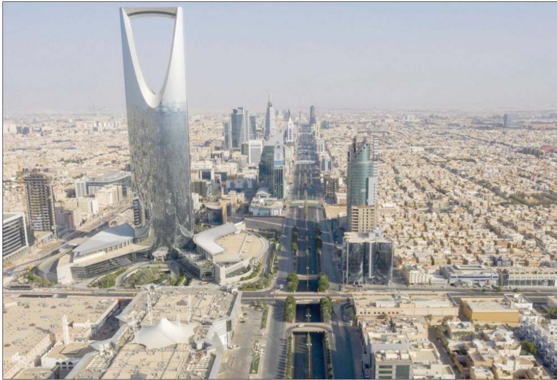
التأمين الصحي السعودي يشهد مفاوضات اندماج واستحواذ (الشرق الأوسط)

جدة، سعيد الأبيض تجري مباحثات موسعة بين شركات تأمين سعودية لمناقشات ست حالات للاندماج والاستحواذ الفترة المقبلة في خطوة لمواجهة تحديات نشاط التأمين المحلي، إذ وفق مصادر تتفاوض حالياً إدارات شركات عاملة للوصول إلى مراحل نهائية من إجراءات الاندماج الكامل أو حالات استحواذ، بهدف مواجهة تطورات السوق وتقديم خدمات تلبي حاجة مستجديات التقدم التقني والرقي. وبحسب مصادر تحدثت لـ«الشرق الأوسط»، فإن التحالفات ستعزز قوة شركات التأمين في تقديم منتجات تتناسب مع المرحلة المقبلة لتغطية احتياج السوق التي تنسارع خطواتها بعد تخطي جائحة فيروس «كورونا»، معتمدة في ذلك على القوة المالية والتقنية الحديثة للوصول إلى شرائح العملاء. وتأتي هذه التطورات وسط تنامي عدد شركات التأمين وإعادة التأمين في المملكة التي وصلت إلى 32 شركة مرخصة من مؤسسة النقد العربي السعودية وحاصلة على رخصة هيئة السوق المالية لتداول أسهمها في السوق المالية السعودية. وتقوم «مؤسسة النقد» وتتركز الخدمات المقدمة من قطاع التأمين على نشاطات رئيسية تتمثل في التأمين الصحي والتأمين العام وتأمين الحماية والادخار، بينما تواصل حالياً شركات التأمين السعودية للخروج من السوق التقليدية في عرض منتجاتها لتتوافق مع المعطيات