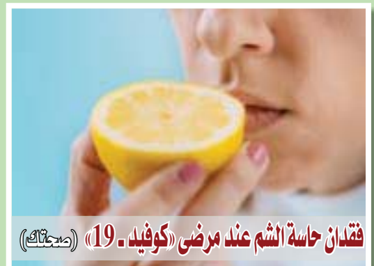
فقدان حاسة الشم عند مرضى (كوفيد-19) (مجتهد)