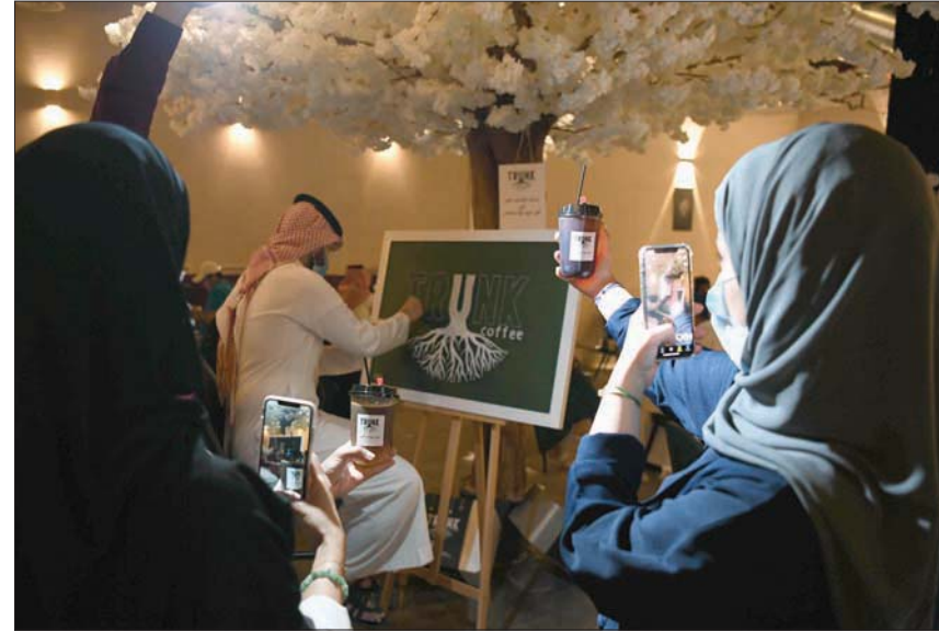
الرياض، الشرق الأوسط،

أشادت منظمة الصحة العالمية بالإجراءات التي اتخذتها السعودية لحماية الحجاج. وقال أمين عام المنظمة تيدروس أدهانوم غيبريسوس، أمس: «أود أن أهنئ المملكة العربية السعودية على المخططة التي اتخذتها لجعل الحج أمناً قدر الإمكان هذا العام». وتابع: «هذا مثال قوي على نوع الإجراءات التي ينبغي على الدول اتخاذها للتكيف مع الوضع الطبيعي الجديد».