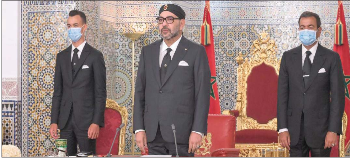
العهال المغربي قبيل لقائه خطاب عبد الجولس ليل أول من أمس وإلى جانبه الأمير مولاي الحسن ولي العهد والأمير مولاي رشيد (ماب)

الاجتماعية الموجودة حالياً، للرفع من تأثيرها المباشر على المستفيدين؛ خصوصاً عبر تفعيل السجل الاجتماعي الموحد»، مشيراً إلى أنه «ينبغي أن يشكل تعميم التغطية الاجتماعية رافعة لإدماج القطاع غير المهيكّل في النسيج الاقتصادي الوطني».