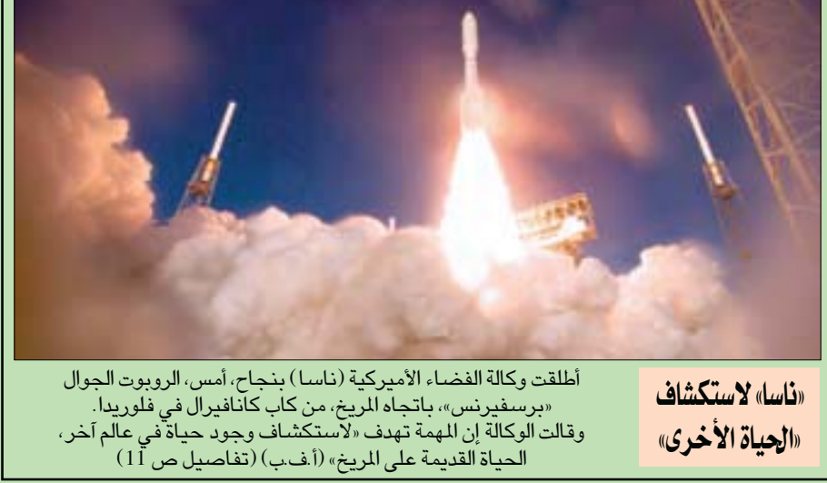
أطلقت وكالة الفضاء الأميركية (ناسا) بنجاح، أمس، الروبوت الجوال «برسفيرنس»، باتجاه المريخ، من كاب كانافيرال في فلوريدا. وقالت الوكالة إن المهمة تهدف «لاستكشاف وجود حياة في عالم آخر، الحياة القديمة على المريخ» (أ.ف.ب) (تفاصيل ص 11)

مديرد، شوقي الرئيس رُجحت مديرية قسم الصحة العامة والبيئة في منظمة الصحة العالمية، ماريًا نيبرا ظهور بؤر جديدة لوباء «كوفيد - 19» في أوروبا، في الوقت الذي تجاوزت الإصابات العالمية 17 مليوناً، والوفيات 670 ألفاً. وقالت: «من الواضح أنه سينضم إلى قافلة الأمراض السارية التي لا بد من التعايش معها. لا بد من السيطرة عليه قدر الإمكان، ومعرفة أكثر لحصر أضراره الصحية والاقتصادية». ومع عودة الإصابات إلى الارتفاع في فرنسا وألمانيا وبلجيكا التي عمدت سلطاتها الصحية إلى تشديد تدابير الوقاية. (تفاصيل ص 4 و 5)