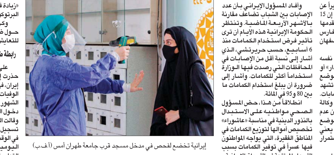
إيرانية تخضع لفحص في مداخل مسجد قرب جامعة طهران أمس

«زيادة في الحساسية والحرص والتزام البروتوكولات الصحية». وتضمنت هيكات إحصائيتين وخبراء إحصائيات وأمراض الأوبئة والبيئات الاجتماعية» وأضاف أنها «مجموعة كل أعضائها في صراع بلا هوادة مع هذه الأزمة وجربت نقاط الضعف»، قبل أن تقول: «نحذر من أن عدم التزام تصويت خبراء الرابطة والجهاز الصحي، سيؤدي إلى إصابات ووفيات بأعداد أكثر دهاء من السابق». وقالت في جزء آخر إن «خطر الإصابات في التجمعات أظهر من الشمس» محذرة بأن «انعكاساته السلبية على المدين القصير والطويل على غالبية الناس، خصوصاً المتدينين، تستدعي اهتماماً خاصاً وفق اعتقادنا في الوقت الحالي، لسبب عدد الوفيات اليومية 1600 في حال لا يتم أخذ التعليمات الصحية على محمل الجد». وجاءت الرسالة وسط خلافات واضحة بين الحكومة ووزارة الصحة حول مناسبة عاشوراء التي تعد أكثر المناسبات حضوراً في إيران، وتمتد على الأيام العشرة الأولى في مطلع السنة الهجرية. وقالت الرابطة في جزء آخر من الرسالة: «في فترات بسبب التقاليد الوطنية والدينية والتجمعات السائدة، نحتاج إلى اتخاذ سياسات ذكية» وشددت على أن المخاوف «تعمق نتيجة الإحساس بالمسؤولية». وأشارت الرابطة إلى أنها تمثل