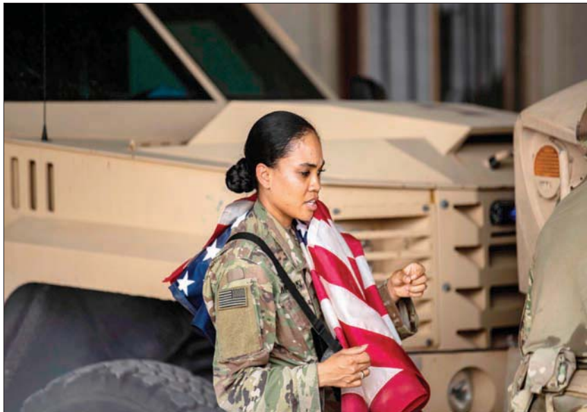
مجندة أميركية تحمل علم بلادها في قاعدة الرميلان شمال شرقي سوريا

رجال الأعمال من السوريين وغير السوريين، للقول إنه «لم يعد ممكناً العيش في العزلين: على الجميع عيش فيه. عالم واشنطن أم عالم النظام»، حسب فهم دبلوماسيين أوروبيين لموقف واشنطن. وهم يلاحظون أن المسؤولين عن الملف السوري في واشنطن، يعتقدون أن «السياسة الأميركية ناجحة وتنجح، إذ إنها زادت من حجم الضغوط على دمشق وعمرت من حسابات موسكو»، مع إشارة إلى فشل محاولات عربية أو أوروبية لفك العزلة عن دمشق والتطبيع معها. وتجنّب رجال أعمال عرب من المساهمة في إعادة أعمالهم سوريا، في مقابل تعاطف عمق الأزمة الاقتصادية في سوريا وفي لبنان.