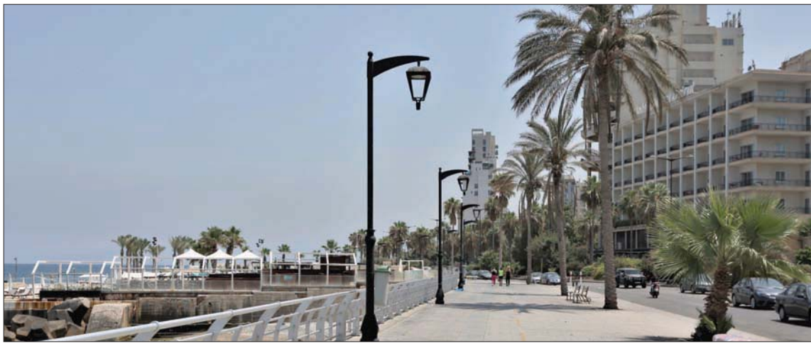
«كورتيش بيروت» بدأ خالياً أمس تزامناً مع تشديد الإجراءات