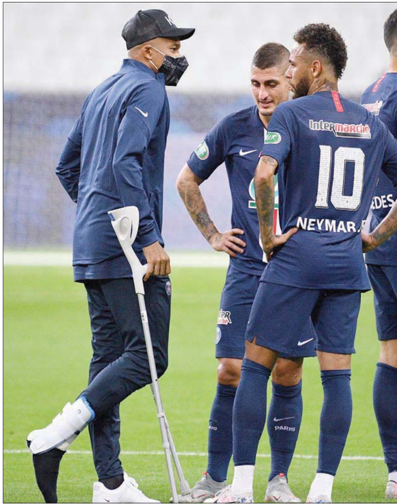
مبابي أبرز الغائبين عن سان جيرمان على عكاز متحدثاً إلى نيمار وفيراتي

بدلاً من مبابي في خط هجومي مكون بالإضافة إليه من الأرجنتينيين ماورو إيكاردي وأنخل دي ماريا ونيمار. ولعب ساراييا دوراً مهماً في الاحتياطي السوبر بدليل تسجيله 14 هدفاً هذا الموسم في مختلف المسابقات. ويعتبر دي ماريا اختصاصياً في نهائي كأس الرابطة، فقد سجل هدفاً في مرمرى ليل في نهائي عام 2016. وأضاف هدفاً وتبريرتين حاسمتين ضد موناكو في نهائي عام 2017. ثم سجل هدفاً ضد موناكو أيضاً في نهائي نسخة 2018. وتعتبر المباراة في غاية الأهمية بالنسبة إلى ليون الذي يتعين عليه الفوز بها لكي يشارك في مسابقة الدوري الأوروبي (يوروبا ليغ) الموسم المقبل وتحاشي الغياب عن المسابقات القارية للمرة الأولى منذ عام 1997 علماً بأنه حل سابعاً في الدوري المحلي.