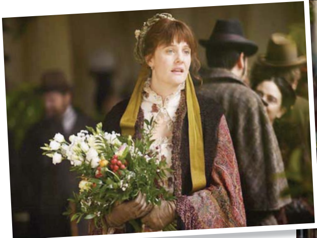
لقطة من فيلم «مس ماركس»

أحلامي» للوكا غواداغنيو كما «بالو كونتي، الحياحة معي» لجورجيو فرديلي، من بين أخرى. وكما كان مهرجان فينيسيا قدّم في الدورة الماضية استعادة لفيلم من إخراج أورسن ولز هو «الجانب الآخر من الريح» يعيد الكثرة هذا العام بنفض الغبار عن فيلم آخر له هو «هوبر- ولز». تم تصويره سنة 1970 وينص على حوار بين المخرجين - الممثلين أورسن ولز ونيس هوبر.