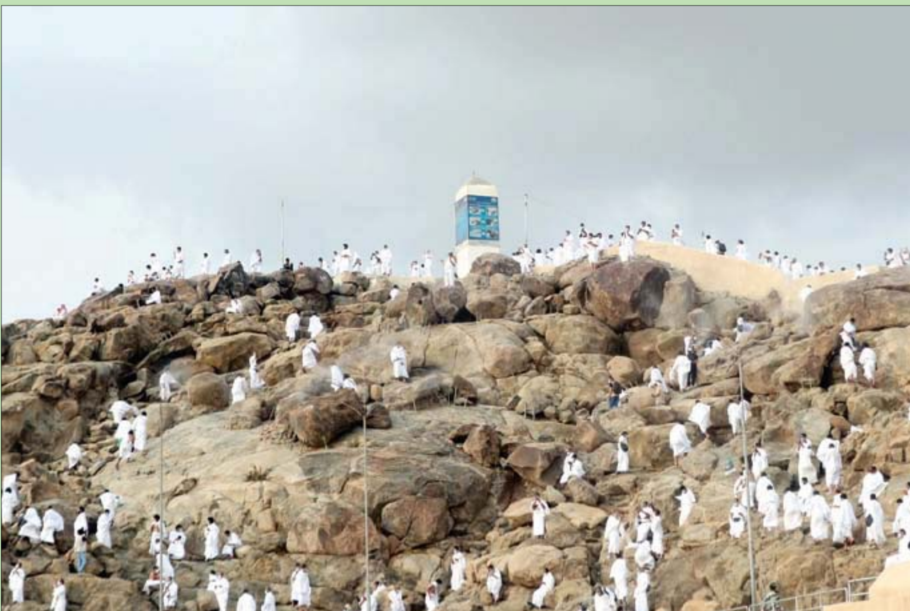
جانب من وصول الحجاج إلى جبل الرحمة في عرفات أمس

وفي أجواء معتدلة مع زخات المطر التي هطلت على المشاعر المقدسة، وقف حجاج بيت الله الحرام الذين يؤدون مناسك حج هذا العام في ظرف استثنائي في صعيد عرفات أمس.