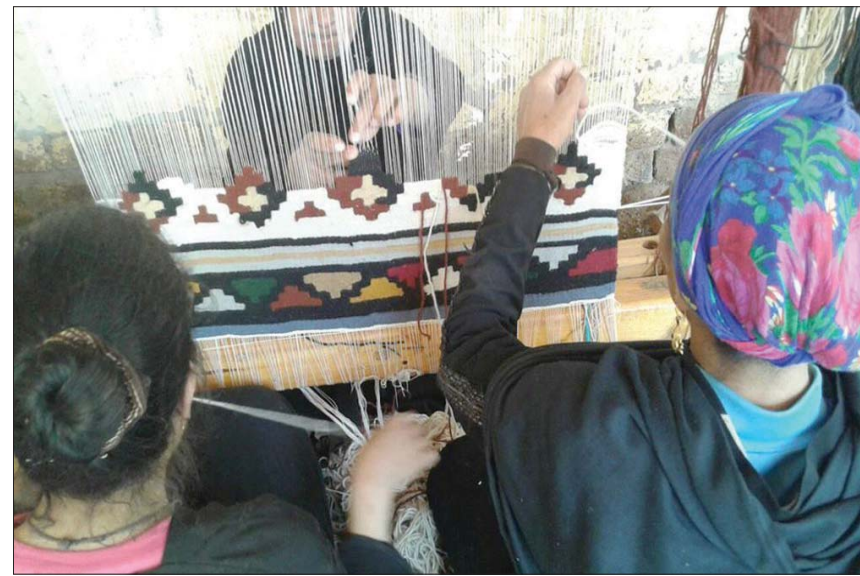
سيدات من قرية بني عدي أثناء عملهن في صناعة الكليم