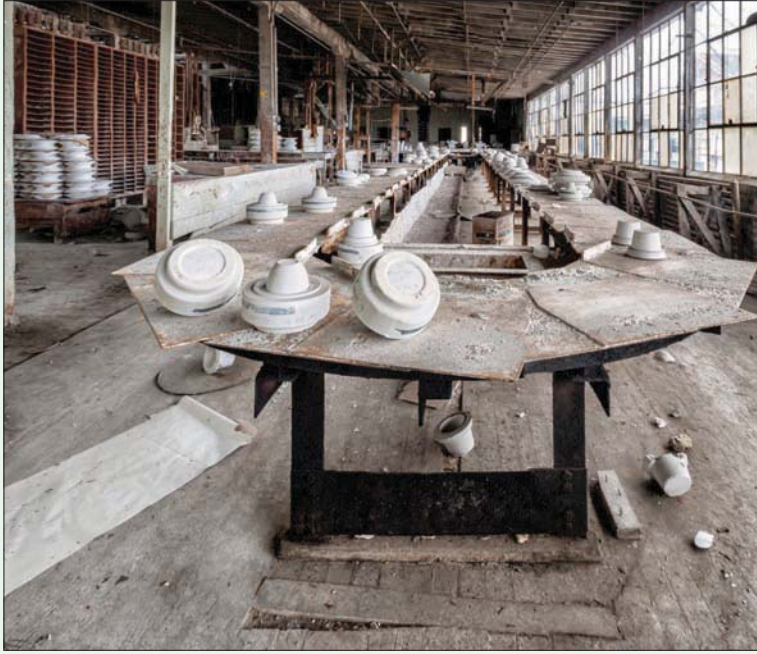
مصنع للخزف تحت طبقات التسيان

نيويورك، كريستوفر ميلي* جماهير من المتابعين يتحركون بدافع من إغراء المغامرة والفضول والحنين إلى الماضي والاهتمام الأكاديمي.