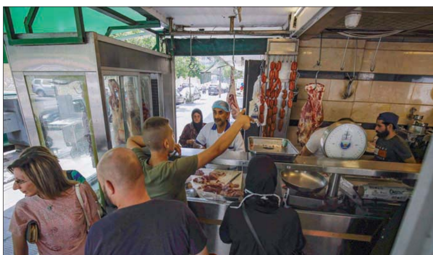
أحد محلات بيع اللحوم في مدينة طرابلس عشية عيد الأضحى

وأمس قال وزير الزراعة عباس مرتضى إن «الأعلاف متوفرة في الأسواق اللبنانية والمتاجر ووضعتا آلية لضبط توزيعها كي لا يكون المزارع ومربي المواشي رهينة لدى التجار».