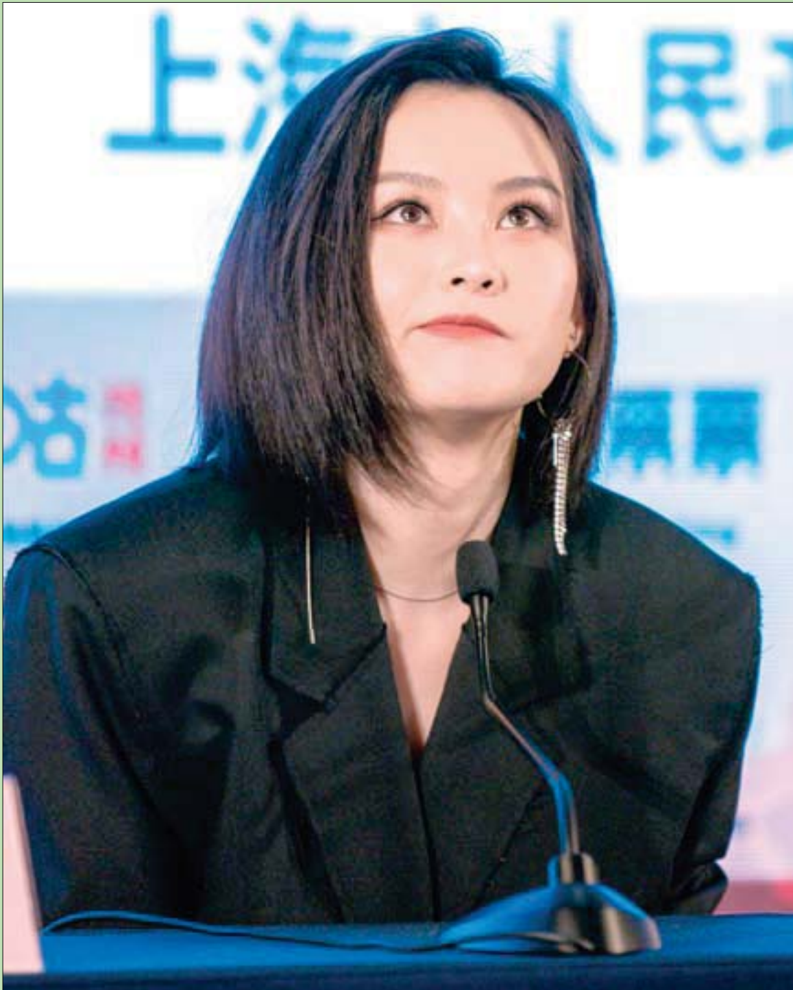
المثلة شانغ يوكسان لدى تقديمها فيلم «موديل» خلال مهرجان شنغهاي السينمائي الدولي

بعد كل هذا، وفي هذا الوقت الحرج، تجد بعض «المتحذلقين» من سعوديين وإيضاً مصريين، يشككون فيما بين الرياض والقاهرة... ليس هذا وقتكم البتة!