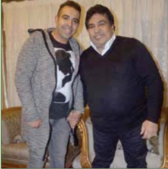
الفنان أحمد عدوية مع ابنه

يضمن تنظيم 40 حفلاً غنائياً ويستمر حتى شهر سبتمبر (أيلول) المقبل، ويشترك فيه كوكبة من كبار نجوم الموسيقى والغناء في مصر والوطن العربي، من بينهم الفنان محمد منير، والموسيقار الكبير عمر خيرت، والمطرب علي الحجار والفنان مدحت صالح، وأوركسترا القاهرة السمفوني، ورائد موسيقى الجاز يحيى خليل، بالإضافة إلى فرق أخرى على غرار «النفخة»، و«مسار اجباري»، و«فرقة أوبرا القاهرة».