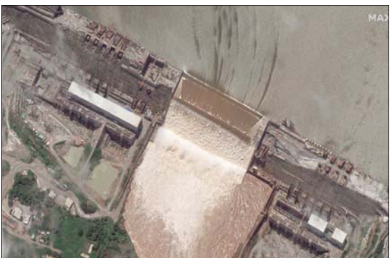
صورة جوية لسد النهضة على النيل الأزرق الثلاثة، الماضي

ومن المقرر أن تعقد مصر وإثيوبيا والسودان، جلسة جديدة، يوم الإثنين المقبل، في إطار السعي نحو التوصل لحل للنقاط العالقة الفنية والقانونية. وترفض إثيوبيا الإقرار بـ«حصّة تاريخية» لعصر في مياه النيل، تقدر بـ5,5 مليار متر مكعب سنوياً، مؤكدة أنها جاءت بموجب «اتفاقيات استعمارية قديمة»، ولا يمكن لها أن «تكبل حقها في التنمية». وفي إطار التحركات المقابلة، تلقى نائب رئيس الوزراء الإثيوبي