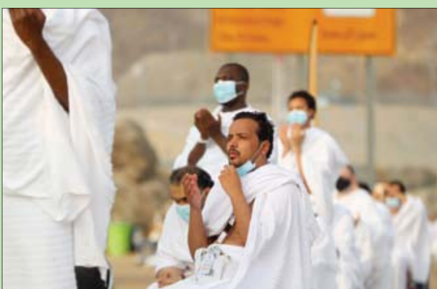
حجاج لدى وقوفهم بصعيد عرفات أمس

وقال اللواء زاهد الطويان نائب مدير الأمن العام، قائد قوات أمن الحج في حديث مع «الشرق الأوسط» إن حج هذا العام يأتي في وقت ما زال فيه العالم يعاني من جائحة كورونا، لذلك أقيم حج هذا العام بأعداد محدودة تحقيقاً لإقامة الشعيرة وتطبيقاً لمقاصد الشريعة الإسلامية في حماية النفس البشرية، وبناءً على ذلك جرى الانتهاء من جميع الخطط الأمنية والمرورية والتنظيمية وخطط الطوارئ.