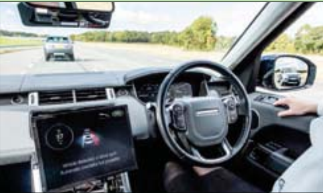
شاشة لا تحتاج إلى اللمس

تريנד المتخصص في موضوعات السيارات. وتطور «جاغوار لاند رووفر» بالتعاون مع جامعة كامبريدج البريطانية شاشة لمس لا تحتاج إلى اللمس بهدف تقليل انتشار الفيروس وتقليل تشتيت انتباه السائق إلى أدنى مستوى، حسب وكالة الأنباء الألمانية. تستخدم التقنية الجديدة التي تم تسجيل براءة اختراعها الذكاء الصناعي ووحدات الاستشعار للتنبؤ بما يستهدفه المستخدم على الشاشة، وهو ما يلغي الحاجة إلى لمس الشاشة بالفعل