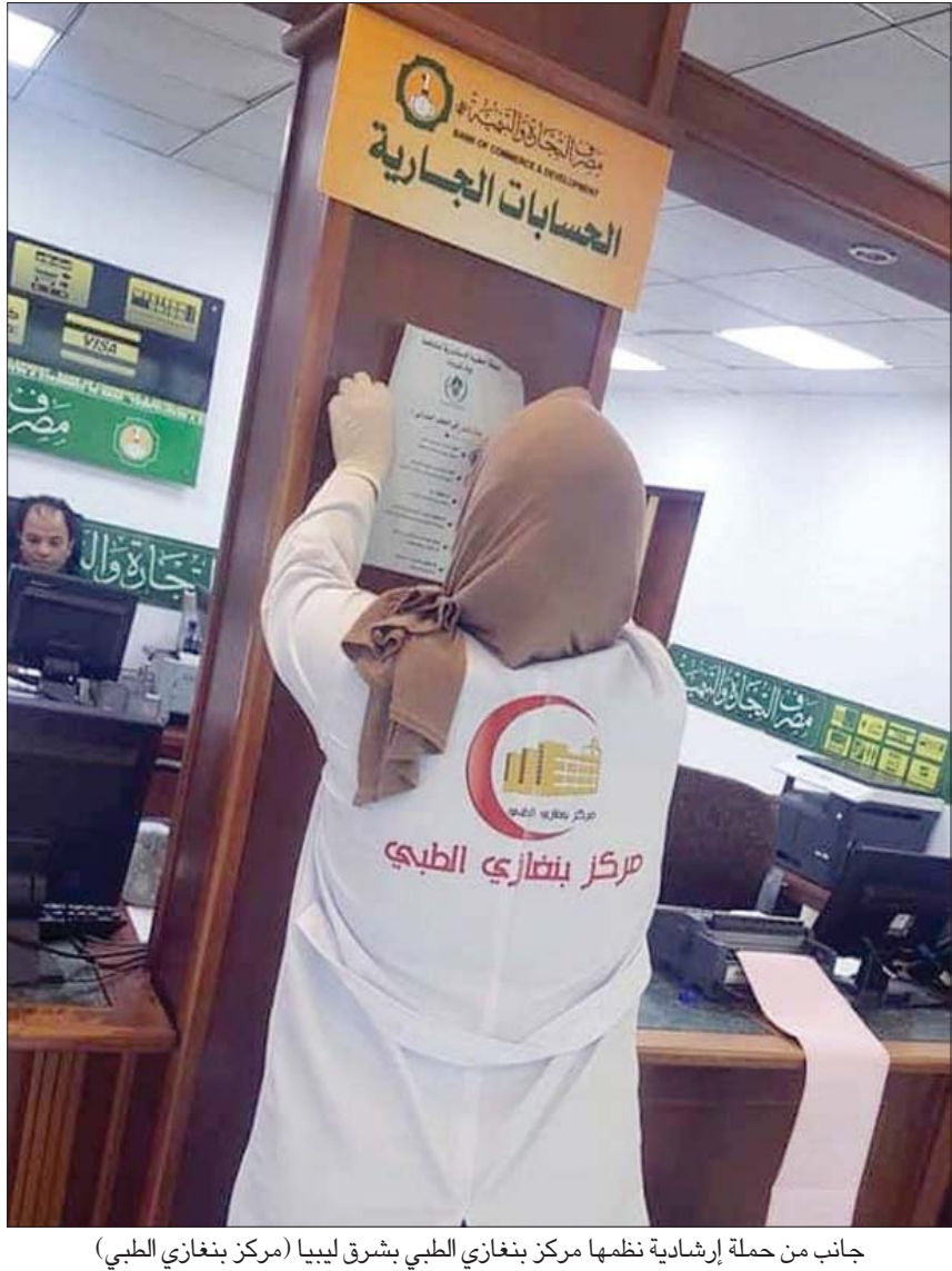
جانب من حملة إرشادية نظمتها مركز بنغازي الطبي بشرق ليبيا

بالتباعد الاجتماعي وحضور المناسبات والاختلاط غير المحمي من قبل المواطنين، إضافة إلى عدم تطبيق الحظر الشامل بشكل صحيح في أيام عيد الفطر المبارك». وأهابت الوزارة بالمواطنين «التقيد التام بالاحتياطات الوقائية، وتجنب جميع التجمعات العشوائية، والاجتماعية، والدينية، حفاظاً على سلامتهم وصحتهم».