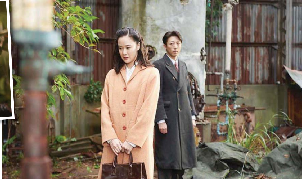
مشهد من فيلم «زوجة جاسوس»

جدير بالذكر أن المتداول حالياً هو منح الأفلام ثلاثة أشهر من عروض الصالات قبل أي وسيط إلكتروني آخر.