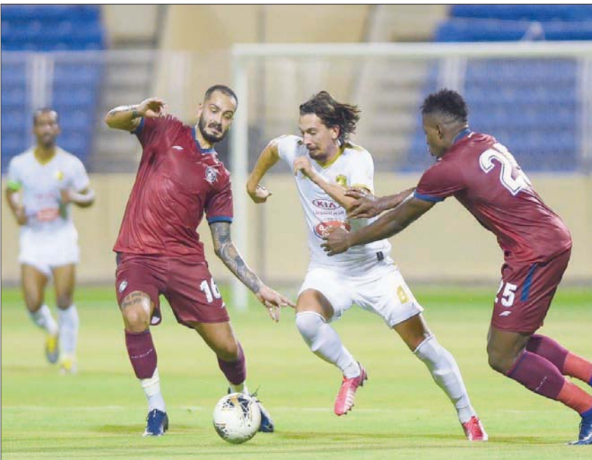
من مباراة العدالة الودية أمام الفتح