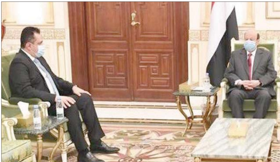
هادي لدى لقائه عبد الملك في الرياض أول من أمس

الجديدة التي يطمح أن يعيش في كنفها الشعب اليمني بأمن وأمان واستقرار». وتتضمن البية تسريع تنفيذ «اتفاق الرياض» نقاطاً تنفيذية نصت على استمرار وقف إطلاق النار والتصعيد بين الطرفين، والذي بدأ سريانه منذ 22 يونيو (حزيران) الماضي، وخروج القوات العسكرية من عدن وفصل قوات الطرفين في أبين وإعادتها إلى مواقعها السابقة. وكان مصدر سعودي مسؤول أكد في بيان له «واس» أنه «جرى العمل على جمع طرفي الاتفاق في الرياض بمشاركة فاعلة من دولة الإمارات، حيث استجاب الطرفان وأبديا موافقتهما على هذه الآلية، وتوافقا على بدء العمل بها، لتجاوز العقبات القائمة وتسريع تنفيذ «اتفاق الرياض»، وانطلاق عجلة التنمية في المناطق المحررة، والدفع بمسارات إنهاء الأزمة اليمنية؛ وعلى رأسها مسار السلام الذي ترعاه الأمم المتحدة ومبعوثها إلى اليمن».