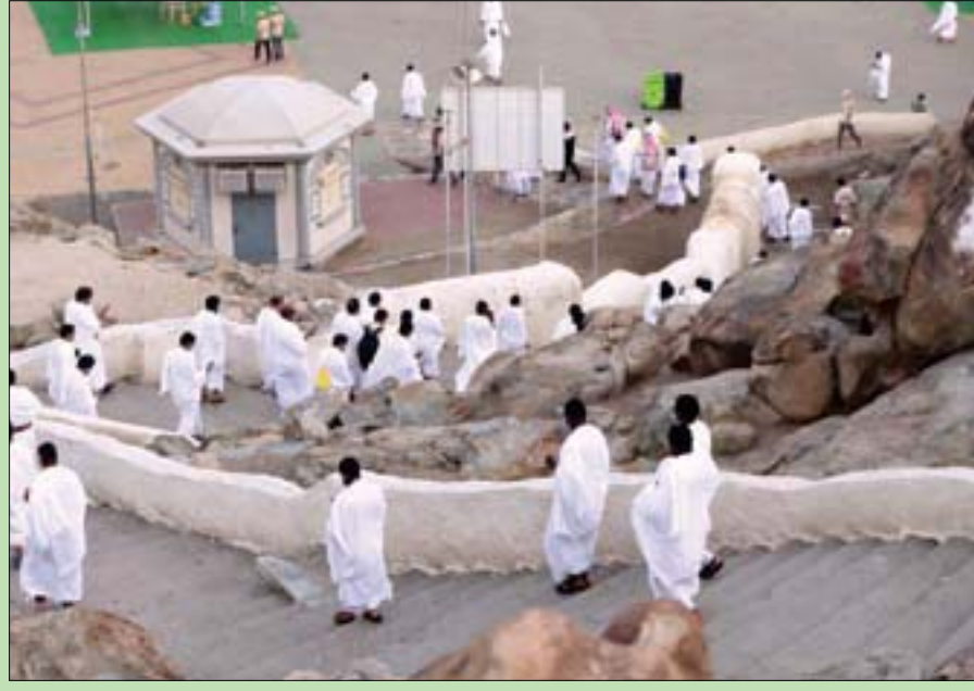
حجاج في مشعر عرفات الطاهر أمس

المشاعر المقدسة، سعيد الأبييض وإبراهيم القرشي يبدأ الحج فجر اليوم، أول أيام عيد الأضحى، رمي الجمرات في مشعر منى، برمي الجمرات الكبرى (جمرة العقبة) بسبع حصيات، وذلك بعد وقوفهم أمس على صعيد عرفات، وأدائهم الركن الأعظم من أركان الحج، قبل أن يبيتوا في مزدلفة، بينما شهدت حركة ضيوف الرحمن انسيابية في التحقل بين المشاعر، وفق خطة التفويج المعدة لذلك. وكشف الأمير خالد الفيصل، مستشار خادم الحرمين الشريفين