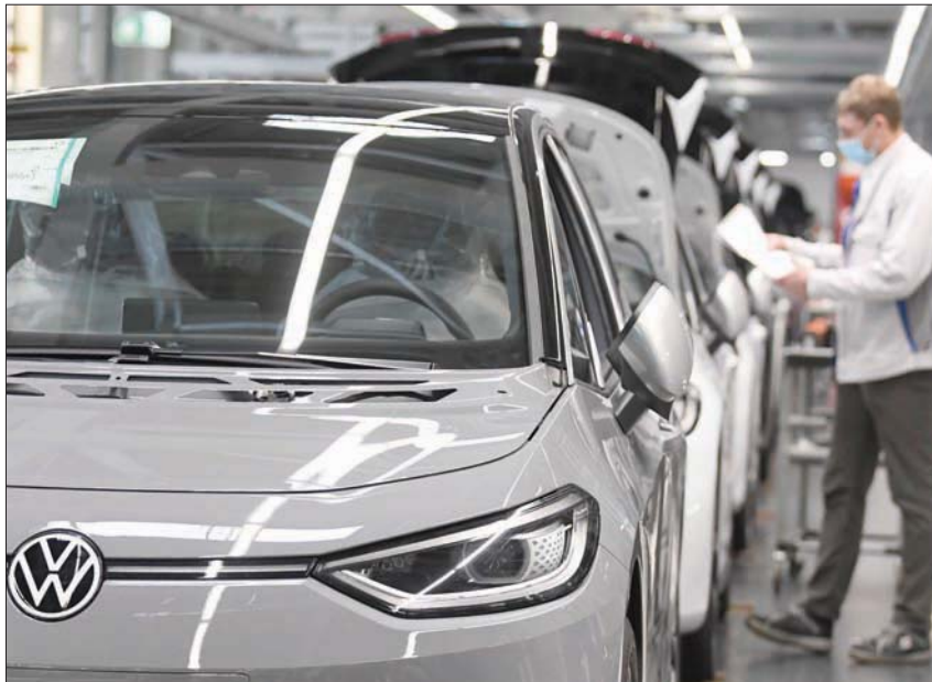
أعلنت فولكسفاغن تسجيل خسائر تشغيل خلال النصف الأول بقيمة 800 مليون يورو

تعويض، إذا تبين أن القيمة المقدرة عن احتساب المسافات المغطوة بالكيلومتر، استنفدت ثمن