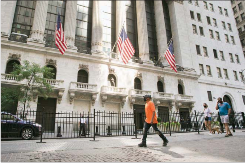
تراجع إجمالي الناتج المحلي الأميركي 32,9% في الربع الثاني

المعدل. وهو يختلف عن مقياس المقارنة مع الربع نفسه في العام السابق الذي تستخدمه دول أخرى. وفي الأشهر الثلاثة الأولى من العام، والتي كانت إلى حد كبير قبل إغلاق جزء كبير من اقتصاد البلاد لوقف انتشار الفيروس في أواخر مارس، انكمش الناتج المحلي الإجمالي بنسبة 4,8 في المائة على أساس سنوي. وقالت شركة الاستشارات المالية «كابيتال إيكونوميكس»، التي أشارت إلى «انهيار غير متسوق في الاستهلاك بسبب تدابير الإغلاق»، «نقدر أن الناتج المحلي الإجمالي انكمش بنسبة 30 في المائة في الربع الثاني على أساس سنوي، ما يزيد على ثلاثة أضعاف الانكماش الفصلي القياسي السابق». وقال الرئيس الأميركي دونالد ترمب، إنه يتوقع انعاشاً اقتصادياً سريعاً، لكن المحللين يبدون أكثر تشككاً وأوضح في حين بدأ الاستهلاك ينعش بقوة في مايو ويونيو؛ ما يهدد الطريق لتعافي قوي في الناتج المحلي الإجمالي في الربع الثالث، فإن «الطريق إلى التعافي بعد ذلك ستكون طويلة، مع احتمال أن يظل الناتج أقل مما كان عليه قبل الجائحة لسنوات». ومرر رينولدز ما قيمته 3 تريليونات دولار تقريباً من الحوافز للمساعدة في تخفيف الأزمة. وفي الوقت الذي لا