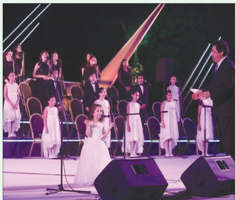
أطفال وشباب قدموا عدداً من الأغنيات التراثية والوطنية المصرية

وأُنشئ مسرح النافورة في دار الأوبرا (وسط القاهرة) خلال فترة «إغلاق كورونا»، ليكون بذلك المسرح المكشوف الثالث بالأوبرا بعد «المسرح المكشوف الرئيسي» و«مسرح ساحة الهناجر».