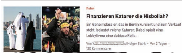
صحيفة «دي تساييت» الألمانية تكشف تمويلًا قطريا لـ «حزب الله»

على أراضيها في أبريل (نيسان) الماضي، بعد أن أعلنت وزارة الداخلية التنظيم إرهابيا. وتسعى برلين لإقناع الاتحاد الأوروبي لاتخاذ خطوة شبيهة مما يسهل عليها عملها في ملاحقة عناصر «حزب الله» لديها، خصوصا أن نشاطاته تمتد في شبكة أوروبية وعالمية. وبعد إعلان حظر الحزب، نفذت الشرطة الألمانية مدامات على عدة مساجد ومراكز دينية مرتبطة بالحزب من دون أن ينفذ أي اعتقال حتى الآن. وقبل يومين، قالت المخابرات السنوية إن «جمعية المصطفى متورطة بتمويل حزب الله». وكان هذا المركز من بين الجمعيات التي طالتها مدامات الشرطة الألمانية في أبريل الماضي، ولكن لم يصدر بعد قرار إغلاقها ولا اعتقال المسؤولين عنها.