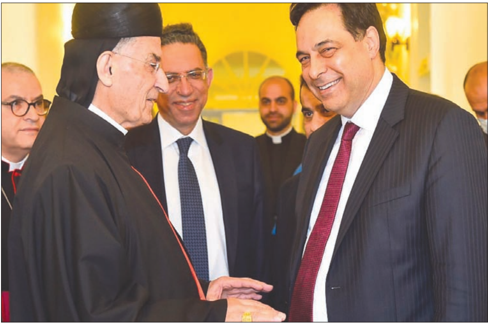
الراعي مستقبلاً دياب في الديمان السبت

وفي المقابل، لم يصدر أي موقف عن رئيس المجلس النيابي نبيه بري الذي يترقب موقف الفاتيكاني من صرخة الراعي ليكون في مقدوره أن يبني على الشيء مقصداً، مع أن مطالبته الراعي بحياد لبنان هي الوجه الآخر للالتزام بلبنان سياسة التأي بالنفس وتحييده عن الحرائق المشتعلة في المنطقة، والتي تتعرض إلى خرق رغم أن الحكومة الحالية والحكومات السابقة أوردتها في صلب بياناتها الوزارية. عليه فإن بيان رهان البعض على تبدل موقف الراعي لم يكن في محله، خصوصاً