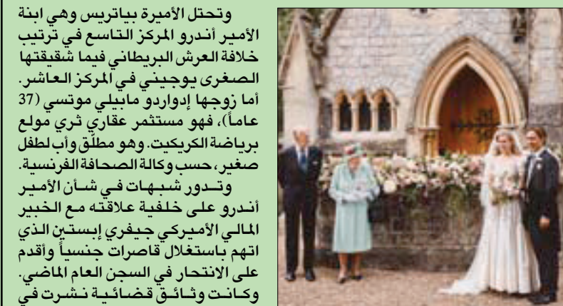
الملكة وزوجها الأمير فيليب في الحفل