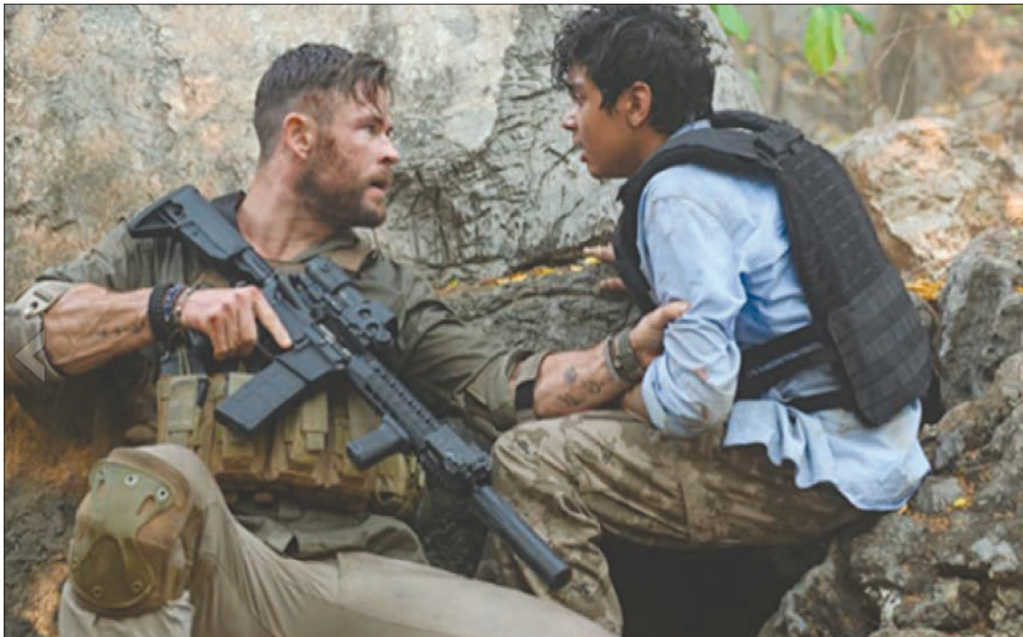
كريس همسورث في «استخراج»

عليها أن تتبّع الشيفرة المعمول بها سينمائياً وهي توفير «نجم شبك» في الإنتاج الواحد. كريس همسورث في «استخراج»، وساندرا بولوك في «بيرد بوكس» (المركز 2)، ومارك وولبرغ في «سينسر كونفيدنشل»، ورايان رينولدز في «أندرغراوند» وبن أفلك في «تريبيل فرونتيير» (المركز 7).