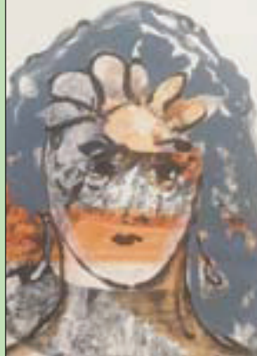
الزخرفة في معظم لوحاتها

على الرجل. «لم أرد أن أظلمه في معرض يحرم المرأة بالتجديد. والحياة كي تكتمل تحتاج إلى شريكها الأساسي؛ المرأة والرجل. أنا بالنهاية امرأة تحاول الدفاع عن بنات جنسها في لوحات تتناول حقوقهن المنتهكة، ومدى الاستخفاف بموقعها، خصوصاً في العالم العربي. فالمرأة في منطقتنا من أقوى نساء العالم ومن حقها حصد نجاحاتها والاستمتاع بها. هي مسؤولة بشكل رئيسي عن الرجل لأنها تربيته وتكبره تحت جناحها، ولذلك على الرجل أن يقدرها ويحترمها».