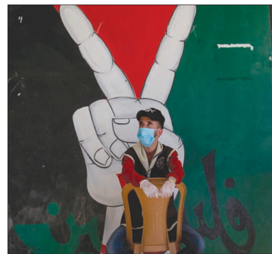
رام الله، «الشرق الأوسط»

السلطة تعوّل على دور روسي لإحياء «الرباعية»