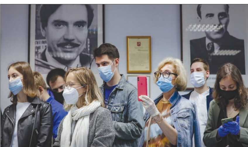
صحافيون يتابعون تصريحات حول انتهاء التجارب الأولى للقاح تطوره روسيا الأربعاء الماضي

في المقابل أن روسيا وبمعزل عن هاتين النقطتين الشائكتين، مستعدة لـ «طى صفحة» الخلافات الدبلوماسية الأخيرة مع لندن، والقيام بأعمال تجارية» مع المملكة المتحدة. والعلاقات بين لندن وموسكو في أدنى مستوياتها منذ تسميم سكرينال في مدينة سانزبير، جنوب غربي بريطانيا. ونفت روسيا أي تدخل في التسميم، لكن المسألة قادت إلى عمليات طرد متبادلة لدبلوماسيين بين لندن وحلفائها وموسكو. ولم يتجدد الحوار بين البلدين إلا في فبراير (شباط) 2019 بعد انقطاع استمر 11 شهراً.