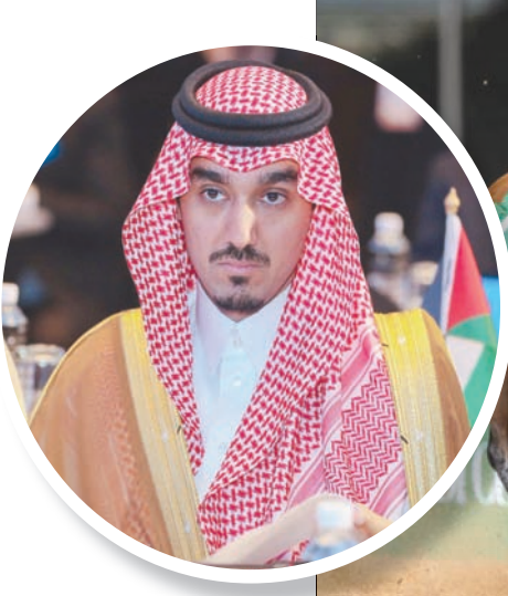
الأمير عبد العزيز الفيصل (الشرق الأوسط)