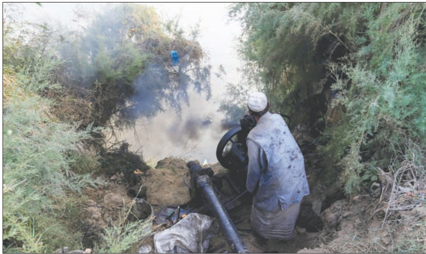
اضطر بعض المزارعين إلى خفض آلات السخ لتصل إلى المياه

القريب من الحدود الإثيوبية، بقوله إن حجم المياه المتدفقة من هناك ظل ثابتاً في حدود 110 ملايين متر مكعب، منذ ستة أيام.