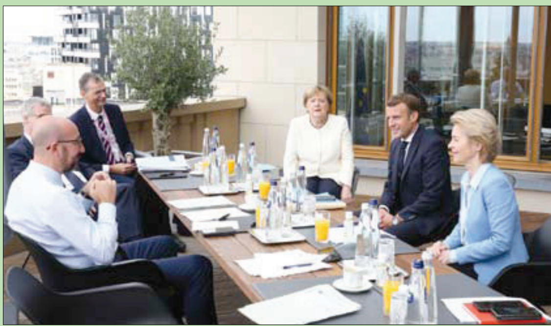
ميركل وماكرون وفون دير لاين في لقاء على هامش القمة الأوروبية لإقرار «صندوق التعافي» من «كورونا» في بروكسل أمس