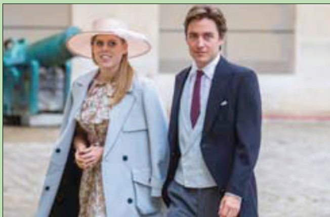
الأميرة بياتريس وزوجها الإيطالي إدواردو مابيلي موتسي

وتحتل الأميرة بياتريس وهي ابنة الأمير أندرو المركز التاسع في ترتيب الخلافة العرش البريطاني فيما شقيقها الصغير يوجيني في المركز العاشر. أما زوجها إدواردو مابيلي موتسي (37 عاماً)، فهو مستثمر عقاري ثري مولع برياضة الكريكت، وهو مطلق وأب لطفل صغير، حسب وكالة الصحافة الفرنسية. وتدور شائعات في شأن الأمير أندرو على خلفية علاقته مع الخبير المالي الأميركي جيفري إبستين الذي اتهم باستغلال قاصرات جنسياً وأقدم على الانتحار في السجن العام الماضي. وكانت وثائق قضائية نشرت في أغسطس ( آب ) 2019، كشفت أن سيدة تدعى فيرجينيا روبرتس تؤكد أنها أقامت علاقات جنسية مع الأمير أندرو أجبرها عليها ابستين عندما كانت في السابعة عشرة. وبعد تخلي شركات ومنظمات عن التعاون مع الأمير وأحدة تلو الأخرى، انتهى به المطاف في نوفمبر (تشرين الثاني) 2019 بالانسحاب من الحياة العامة والابتعاد عن الأضواء.