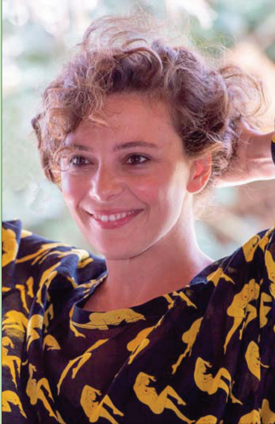
المثلة الإيطالية جاسمين ترينسا خلال مقابلة في مهرجان «دي تافولارا» لعام 2020 في إيطاليا

الدعم السعودي، والعربي، للدولة العراقية واستقلال قرارها الوطني وتقوية مركز الدولة على حساب دويلات الميليشيات، أمر حميد ومسعى شريف، وعمل عقلائى أيضاً. صحة العراق هي صحة لجيرانه، كل جيرانه، إلا من يريدون تخليد المرض في العراق، لأنهم إنما يحيون في برقة الوباء.