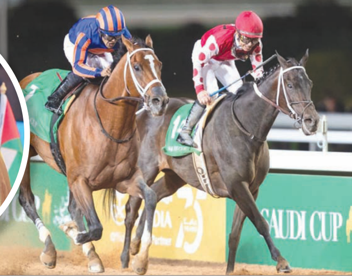
رياضة الفروسية تحظى باهتمام كبير من حكومة المملكة