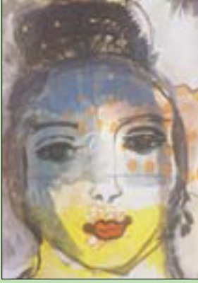
لوحة من المعرض

وتختتم كامل قائلة: «لوحاتي النسائية تلخص شيما كامل الحاضرة فيها بشكل أو بآخر. تتولى بانعكاسات للأشياء من حولي كأي امرأة أخرى تعيش في محيط معين».