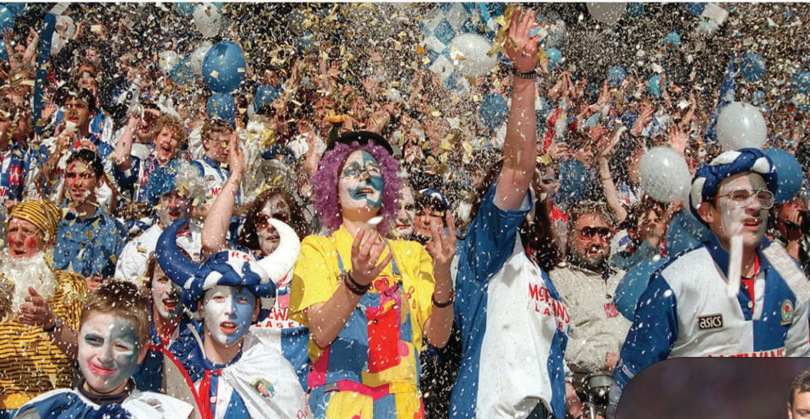
مشجعو بلاكبيرن (الغارديان)

لكن مباراة الفريق عام 1992، لليفربول على ملعب «أنفيلد» كانت في مستوى مختلف تماماً. ولن أنسى ما حيت مشاهدة تلك المباراة على شاشة التلفزيون، فقد كنت أشاهدها في الصالة مع صديقي المفضل، ومع والدي، بالإضافة إلى صديق آخر كان من مشجعي مانشستر يونايتد. أتذكر أن كيني دالغليش كان يقف بجوار خط الغمسة وعلامات الحسرة على وجهه، وكانت تلك المشاعر السلبية تسيطر علينا جميعاً. وضع إطلاق حكم اللقاء صافرة النهاية ومعرفتنا بفوز بلاكبيرن روفرز باللقب، أصيب والدي بالجنون التام. ودخلت أمي وطلعت منه الهدوء، وقد صديقي الآخر، الذي كان يشجع مانشستر يونايتد، كان غاضباً للغاية. لكن والدي لم يتوقف وكان يصيح قائلاً: «لا اهتم بأحد، فقد فاز بلاكبيرن روفرز بلفب الدوري!». لا تزال كل تلك التفاصيل محفورة في ذاكرتي، وسوف تظل كذلك حتى يوم وفاتي. لقد كانت كرة القدم هي أعظم شيء أشاركه مع والدي، وكان فوز الفريق الذي نشجعه بلفب الدوري هو إحدى أفضل اللحظات في حياتي.