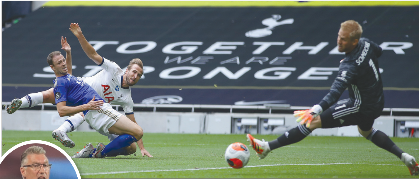
هاري كين (في الوسط) يسجل أول أهدافه من ثلاثة توتنهام في شبك ليستر

في المقابل رفع الفوز ترتيب بيرنلي أعلى من إرسال في المركز التاسع برصيد 54 نقطة من 37 مباراة متأخراً سابقاً نظمت عن ولفرهامبتون بخصوص المركز السادس الذي خاض مباراة أقل.