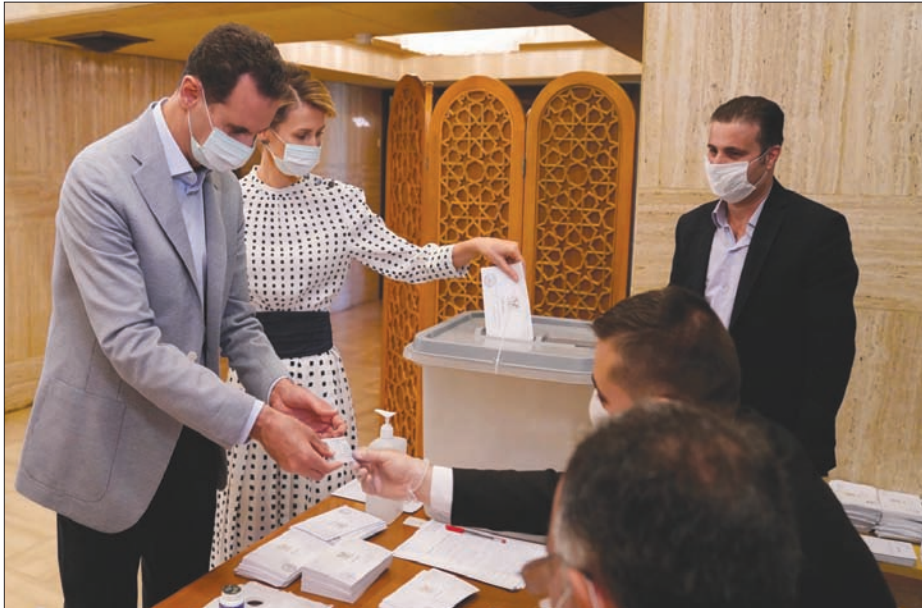
بشار وأسماء الأسد داخل مركز اقتراع في دمشق أمس

ويضم مجلس الشعب 250 مقعداً، ومع أن تخصصت للعمال والفلاحين، والنصف الآخر لبقاى فئات الشعب، فإن غالبية المرشحين المستقلين هم من رجال الأعمال وأمرأة الحرب.