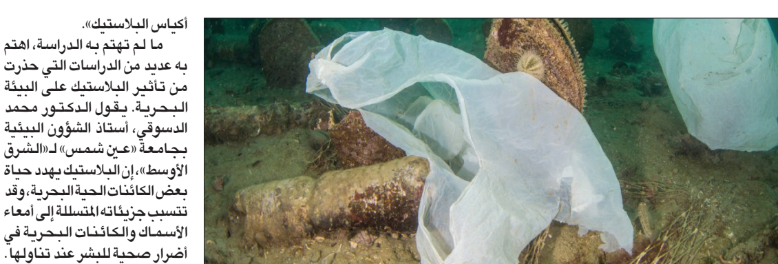
البلاستيك حمى على «الكوكاكولا» لمدة 20 عاماً في أعماق المحيط