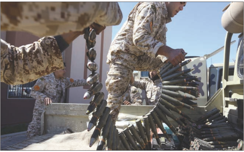
قوات من مصراتة مساندة لحكومة «الوفاق» تعد معركة ضد الجيش الوطني (أ.ف.ب)

صدر على هامش مباحثات أوروبية في بروكسل تتناول خطة الإنعاش الاقتصادي، أول من أمس (السبت)، إنه اللجوء المحتمل إلى العقوبات، إذا تواصل خرق الحظر بحراً أو براً أو جواً، وأضافوا: «ندعو كل الأطراف في ليبيا، وكذلك داعمهم الأجانب، إلى وقف فوري للمعارك»، معربين