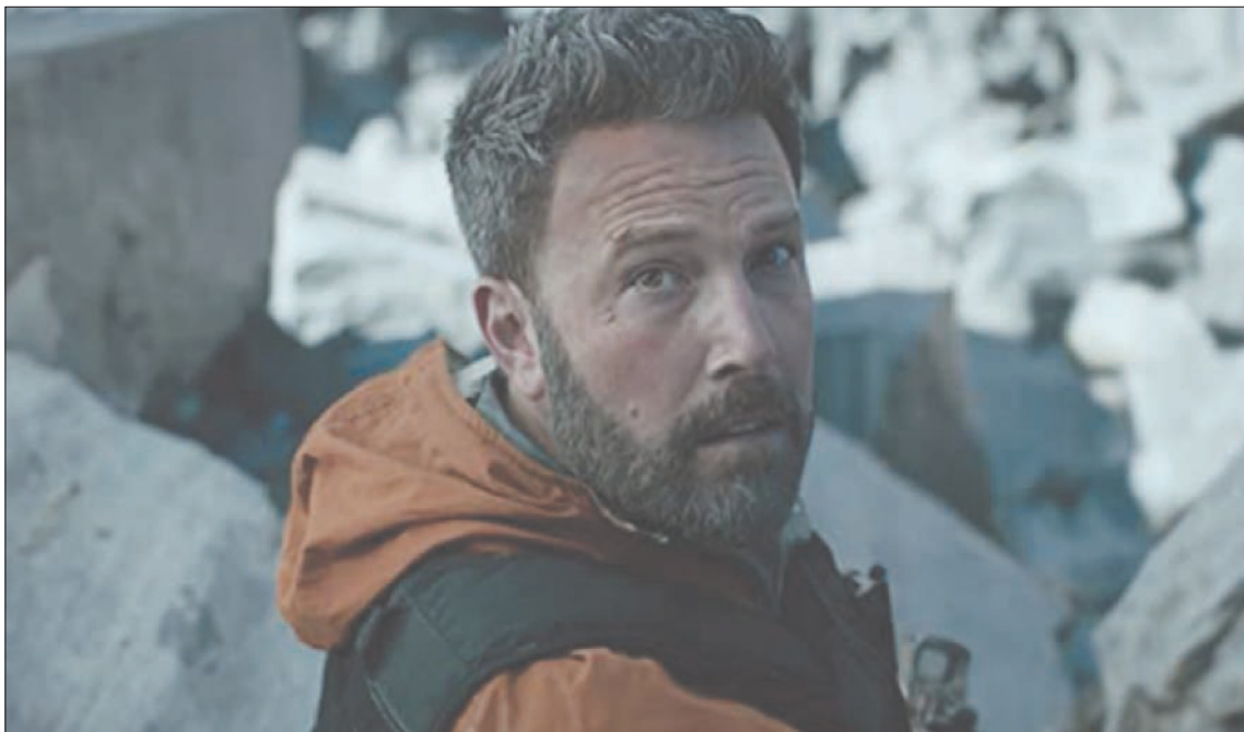
بن أفلك كما ظهر في «جبهة ثلاثية»

الواعز الكفيل بإعادة الناس إلى صالات السينما ليس متكاملًا بعد. من ناحية هناك الخوف من البلاء، والأرقام اليومية صادمة في الولايات المتحدة وحول العالم،