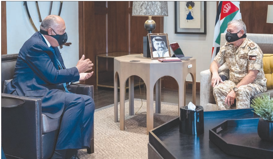
الملك عبد الله الثاني مستقبلاً وزير الخارجية المصري في العاصمة الأردنية أمس

حدث اتصال مع الرئيس يوم الجمعة الماضي». وتأتي الرسالة المصرية، عشية قمة مصغرة يعقدها الاتحاد الأفريقي، للباحثين