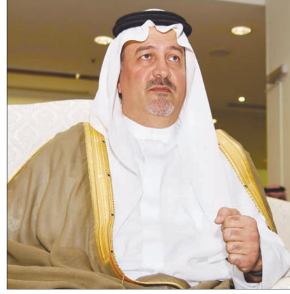
الأمير بندر الفيصل