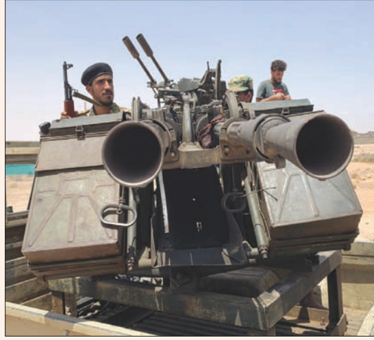
قوات تابعة لـ «الوفاق» تعد للهجوم على سرت

في 18 مايو (إسار) الماضي، بدعم من تركيا. وقامت القوات التركية بأشغال البنية التحتية لإعادة تأهيل القاعدة، وتم خلال الأسابيع الماضية نشر منظومة دفاع جوي متوسطة المدى من طراز «هوك»، بالإضافة إلى رادارات وأنظمة للحرب الإلكترونية، إلا أن القاعدة تعرضت لضربة جوية في 3 يوليو (تموز) الحالي خلال زيارة وزير الدفاع التركي، خلوصي أكار، ورئيس الأركان يشار جولر، وتم تدمير منظومة الدفاع الجوي وادارات نصبتها تركيا في القاعدة الليبية، فيما قالت أنقرة إن طائرات مجهولة الهوية هي التي نفذت الهجوم. وفي السياق ذاته ذكرت تقارير أن عشرات العربات العسكرية تابعة لقوات الوفاق انتقلت من مصراتة إلى سرت، على متنها 300 مقاتل بينهم مرتبة من سوريا وتونس يعملون لحساب تركيا.