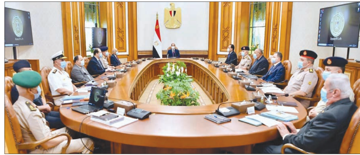
اجتماع «مجلس الدفاع الوطني» المصري في القاهرة أمس برئاسة الرئيس السيسي

وأكدت صحيفة «ميليت» أن القوات المسلحة التركية تواصل الدعم اللوجيستي وإرسال المعدات العسكرية إلى حكومة الوفاق، حيث تم إرسال طائرتي شحن عسكريتين من طراز «لوكهيد سي 130 إي» و«إيه 400 إم» في قاعدتي الوطية ومصراتة في غرب ليبيا. وأشارت الصحيفة إلى أن الصواريخ التي وصلت إلى ليبيا ووضعت بالقرب من سرت، يصل مداها إلى 40 كيلومتراً، وسبق استخدام الطراز نفسه بشكل فعال في العمليات العسكرية التي نفذها الجيش التركي في سوريا. وكان موقع الرصد العسكري الإيطالي «إيتمال رادار» ذكر أول من أمس أن طائرة من طراز «لوكهيد سي - 13 إي» تحمل الرقم (1468 - 71) غادرت قاعدة كونيا في وسط تركيا، واتجهت مباشرة إلى قاعدة الوطية في غرب ليبيا، بعد أن كان من المعتاد أن تهبط طائرات الشحن التابعة