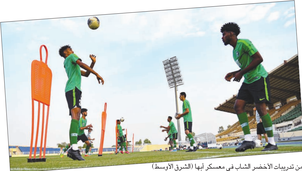
من تدريبات الأخضر الشاب في معسكر أبها (الشرق الأوسط)

ويستعد المنتخب السعودي للحفاظ على لقبه بعد أن حقق في عام 2018 بطولة آسيا تحت قيادة المدرب الوطني خالد العطوي بعد غياب طويل عن المنجزات على الصعيد القاري لهذه الفئة السنوية للمنتخب.