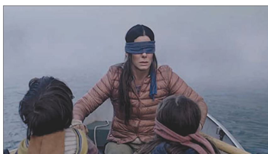
ساندرا بولوك في «بيرد بوكس»

وحتىما توفر «نتفليكس» المنوال ذاته في فيلمها المعروف بنجاح «الحارس القديم» (The Old Guard)، تفوق بطولته تشارليز ثيرون. في كل هذه الأفلام المذكورة تحتاج الشركة المنتجة اسماً كبيراً واحداً تحيطه بالمعلنين الذين لن يتقاضوا - في مجموعهم - ما يتجاوز ما