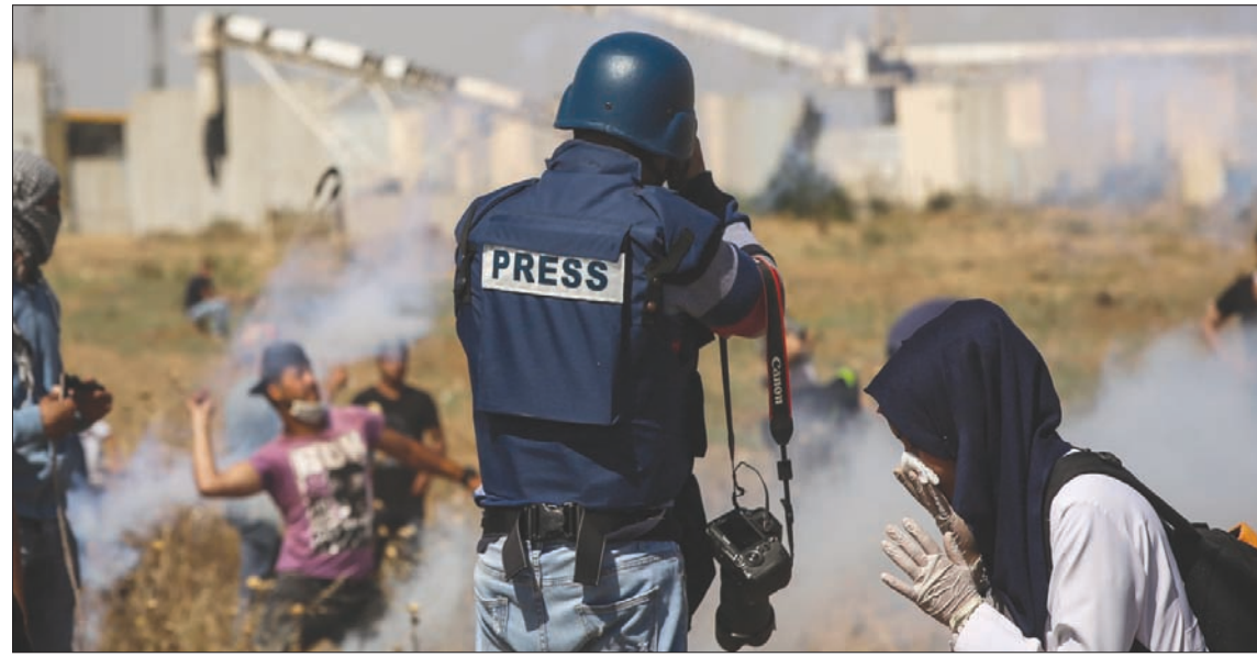
يواجه الصحفيون الفلسطينيون صعوبات ومخاطر كثيرة في عملهم

تلك هي الخطة إذن: «استغلال الدراما والإنتاج الفني والإعلامي من أجل ترويج خطة إردوغان في المنطقة». قررت تركيا، عنية اندلاع الانتفاضات، تكثيف اهتمامها بالتوجه للتأثير في عقول العرب وقلوبهم، عبر إطلاق منصات ناطقة بالعربية، وتعزيز التمركز العربي لوكالة الأناضول الرسمية، وإنشاء عدد من المواقع الإلكترونية والمراتب الحثيثة المتخصصة، حيث ستهدف هذه المنصات «إلى عرض البانوراما التركية على المشاهد العربي»، وإجراء حوارات مع مثقفين أتراك وعرب، وتنظيم لقاءات بينهم، لإحداث مزيد من التقارب والألفة بين الجانبين، كما ستركز على إبراز «عظمة» تركيا، و«عظمة» قائدها إردوغان، و«عظمة» تاريخها، و«عظمة» الخلفاء العثمانيين، قبل أن تتنصت للحروب والهجمات الثابتة على النظام السوري (حليف الأسد)، وعلى الخليجين باستثناء قطر، وعلى مصر بعد إطاحة «الإخوان»، وعلى حقتر في ليبيا، وعلى كل موقف سياسي أو جهه لا تفتح الباب أمام العثمانية الجديدة، ولا تؤمن بزعماء إردوغان.