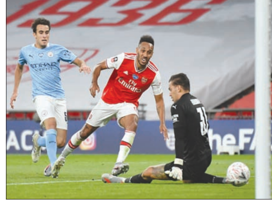
أوباماينغ نجم أرسنال يسجل هدفة الثاني في مرمره سيتي

وكان غوارديولا أول المهتمين بفوز مساعده السابق، وربما يتنجح في التقليل من أثر الهزيمة مع امتلاك الفرصة الأكبر في التقدم في دوري أبطال أوروبا حيث يتفوق 2 - 1 على ريال مدريد قبل أن يستضيف مباراة إياب دور الستة عشر.