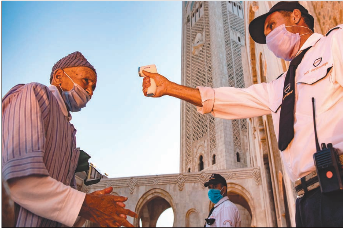
موظف يقيس درجة حرارة مصلى أمام مسجد في كازابلانكا

من المحتمل تعرضها للتلوث بالنسبة 27 في المائة وتفاذي نقط البيع المكتظة 25 في المائة. كما سيتم اتخاذ احتياطات أخرى، تضيف المذكرة، كتجنب الخروج إلا في حالة الضرورة القصوى بالنسبة 20 في المائة من الأسر، وتجنب لمس الأشياء بالنسبة 13 في المائة. وبالمقابل، صرحت 4.9 في المائة من الأسر، أي 414 ألف فرد، أنها لن تتخذ أي إجراء وقائي، أي 7.1 في المائة في الوسط القروي، و4 في المائة في الوسط الحضري. وينتمي نصفهم تقريباً (48 في المائة) إلى 40 في المائة من الأسر الأكثر فقراً، في حين ينتمي 20 في المائة بين الأسر التي يسيروها بشكل غير نشيط، وفي المائة منهم إلى الأسر التي يسيروها بشكل نشيط، و15 في المائة منهم إلى الأسر التي على رأسها مستقل فلاح.