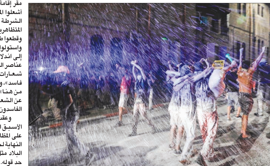
تل أبيب، «الشرق الأوسط»

مع تجدد المظاهرات الصاخبة في تل أبيب والقدس، التي انطلقت مساء أول من أمس (السبت)، واستمرت حتى فجر أمس (الأحد)، احتجاجاً على سياسة الحكومة بشكل عام، والغفل في معالجة كوروناً بشكل خاص، والمظاهرات التي أغلقت شوارع تل أبيب والقدس ويتر السبع وحفا، أمس، من قبل العاملين الاجتماعيين، والمظاهرات التي يطالب قسم منها برئيس الوزراء، بنيامين نتيناهو، بالاستقالة والاعتزال. كشفت مصادر في الشرطة أنها أعدت خطة لمواجهة عصيان مدني في مرحلة ما من مراحل الاحتجاج الجماهيري. وأكدت أن الشرطة تأخذ جدية تهديدات التنظيم الجديد لحركة الاحتجاج التي بدأت تتخذ طابعاً عنيفاً، وتهديدات «منظمة الأمل» التي أقامها عدد من لجان التجار والحرفيين وأصحاب المصالح الخاصة، وتحذروا فيها بصراحة عن عصيان مدني.