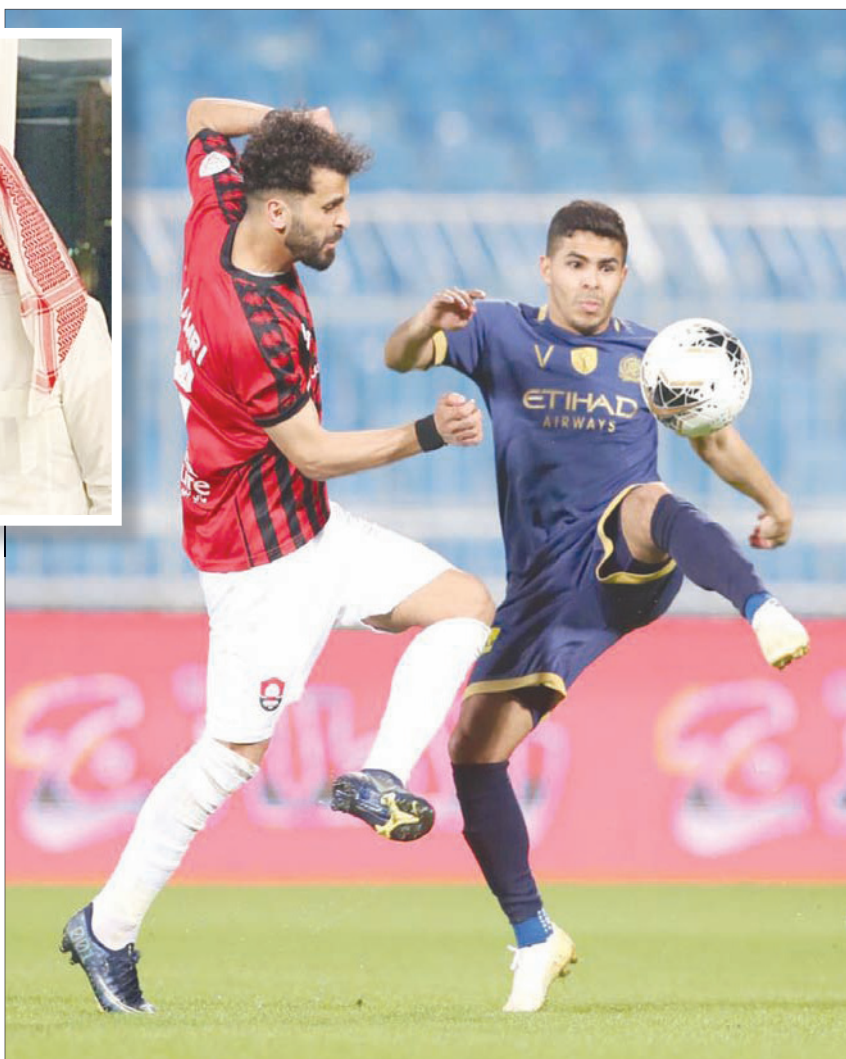
يحيى الشهري خلال إحدى مبارياته مع النصر

وبشأن عجز بعض الأندية الكبيرة عن صناعة لاعبين من فرقتها بدلاً من الاعتماد على شراء عقود لاعبين من أندية أخرى أو حتى توقيع عقود حرة مع لاعبين من أندية كبيرة أخرى، قال الشبيحة: «بكل تأكيد الأندية التي تريد المنافسة تتجه أحياناً للاعب الجاهز والذي يملك كل المعلومات والإمكانات الفنية التي يتمتع بها بدلاً من أن تجلب لاعباً من أحد أندية الوسط ولا يتمتع بتجربة كبيرة أو خبرة واسعة من خلال خوض البطولات الكبيرة أو الانضمام للمنتخب الأول ولذا من الطبيعي أن تحصل مثل هذه الصفقات في زمن الاحتراف وحسب قدرة كل نادٍ وطموحه».