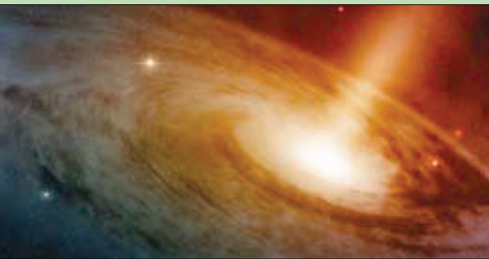
الثقوب السوداء 28 قد جرى الخلط بينها وبين المجرات البعيدة

السماء، ولكن حتى الآن، لم يتمكن علماء الفلك من رصد كثير منها كما كانوا يتوقعون من قبل». ويشير هذا البحث الجديد - الذي يستند إلى ملاحظات في بقعة واحدة فقط من السماء الجنوبية - إلى أن العديد من تلك الثقوب السوداء البعيدة ربما تكون مخفية عن أعين الجميع في السماوات المفتوحة ولا يلحظها أحد. كانت الدراسة المشار إليها قد أجريت تحت إشراف عالمة الفلك إيريني لامبراديس من جامعة جونز هوبكنز في بالتيمور بولاية ماريلاند.