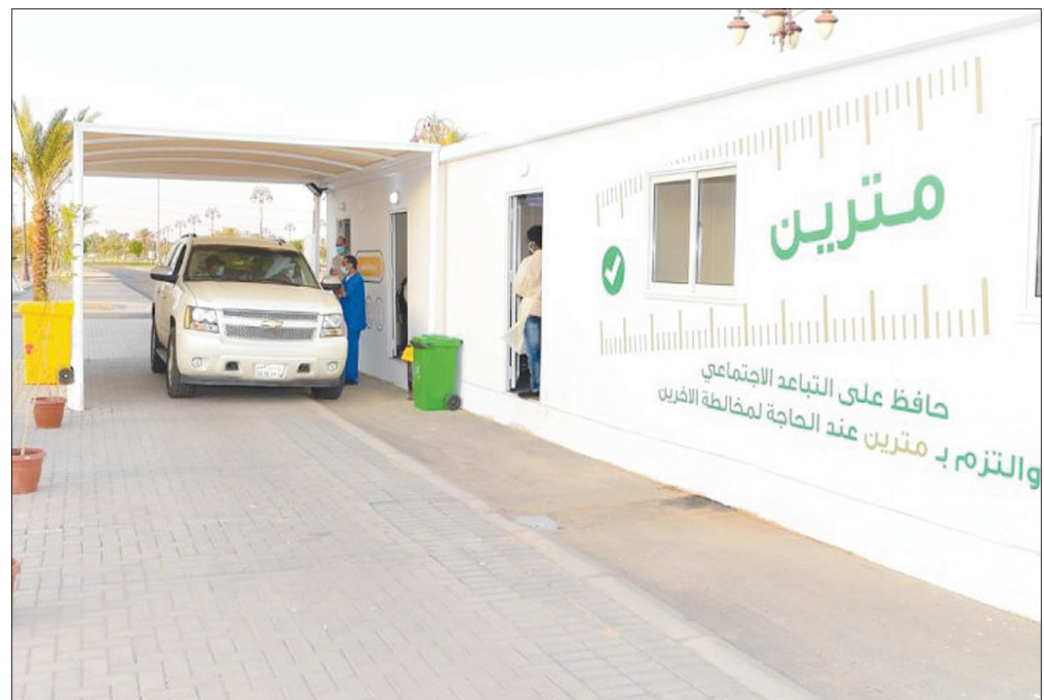
السعودية تسبغ على الفيروس عبر انتشار مراكز الفحص المجاني (واس)

إصابة جديدة بفيروس كورونا، وبذلك يبلغ مجموع الحالات المسجلة 56,922 ألف حالة. وأعلنت الصحة الإماراتية عن وفاة جديدة، ليبلغ عدد الوفيات 339 حالة، كما أعلنت عن شفاء 352 حالة، وبذلك يكون مجموع حالات الشفاء 49,269 ألف حالة.