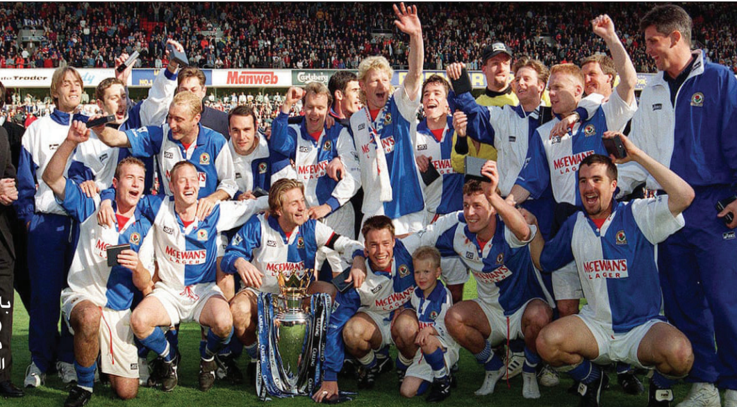
فريق بلاكبيرن وكأس بطولة الدوري

دالغليش أسهم في تحويل بلاكبيرن من نادٍ صغير إلى بطل الدوري الإنجليزي