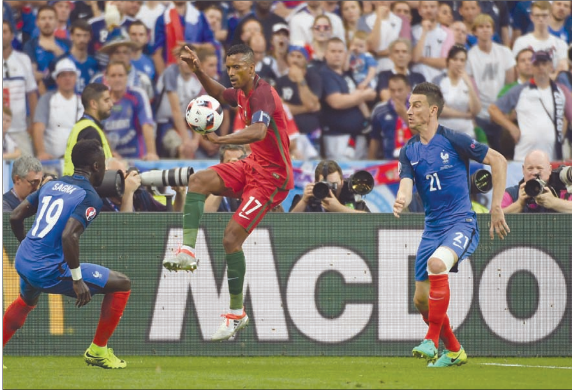
«بي إن» ارتكبت ممارسات احتكارية بحق الراغبين في الاشتراك لمشاهدة كأس أمم أوروبا 2016

على تجديد اشتراكهم في باقتهم الأساسية لمدة سنة كاملة أخرى، وذلك كشرط لمشاهدة بطولة «يورو 2016»، رغم أن مدة اشتراكهم سارية وتغطي المدة التي أقيمت خلالها البطولة المذكورة، وأشارت الهيئة إلى قيام مجموعة قنوات بي إن سبورت بتضمين قيمة الاشتراك في القنوات الرياضية ذاتها تكاليف بطولات ورياضات قد لا يرغب المشركون في متابعتها، ومع ذلك يرغمون على تحمل تكاليفها ضمن قيمة الاشتراك. وأشارت هيئة المنافسة إلى أن ذلك يعد مخالفة صريحة لنظام المنافسة ولائحته التنفيذية، وبناء عليه اتخذ مجلس إدارة الهيئة التدابير اللازمة لإيقاف الممارسات وإزالة المخالفات الاحتكارية التي ارتكبتها مجموعة قنوات بي إن سبورت مع احتساب الغرامة اليومية المقررة في نظام المنافسة بحدها الأعلى؛ حرصاً على سرعة إزالة الضرر عن المستفيدين من خدماتها بالملكة.