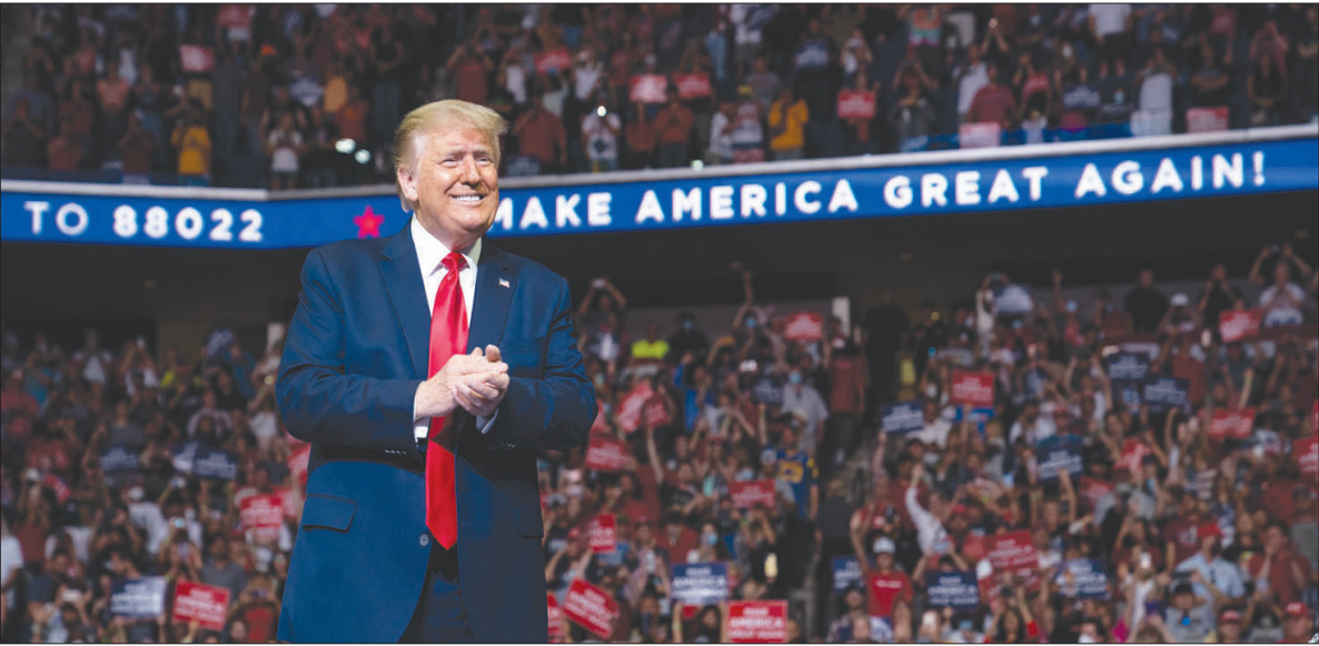
ترمب خلال مؤتمر انتخابي في أوكلاهوما الشهر الماضي

للدعمفم باتجاه دعم بايدن، كما دعموا كليبنتون في عام 2016. وتعمل الحملة على تسليط الضوء على سياسات ترمب المتعلقة بالهجرة لتحفيز الناخبين للتصويت لصالح بايدن، إضافة إلى تنكبرهم بتصريحاته المثيرة للجدل إثر إعصار ماريا الذي ضرب بورتوريكو في عام 2017، خصوصاً أن عدداً لا بأس به من سكان فلوريدا هم من بورتوريكو. وتقول جينيفر مولينا، المسؤولة عن القسم الإعلامي للاتيني في حملة بايدن: «نحن لن نستخف بهذه الانتخابات؛ الصوت اللاتيني في غاية الأهمية، لهذا نحن نسمى لتحفيز الناخبين منهم، ودعمهم نحو دعم بايدن».