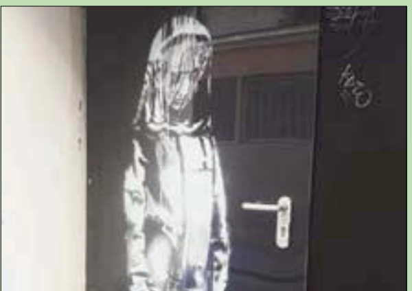
فتاة بانسكي الحزينة