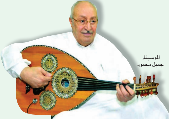
الموسيقار جميل محمود