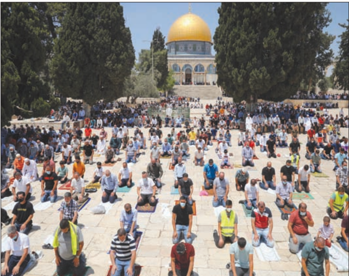
مصلون في باحة المسجد الأقصى يراعون التباع يوم الجمعة الماضي (آب)

تلجا محاكم الاحتلال غير المعترف بها. كما دعت الحركة، منظمة التعاون الإسلامي وجامعة الدول العربية إلى التحرك سريعاً لوقف الخطر الذي بات يتجول في جنبات الأقصى، واستخدام كل السبل للضرب على يد الاحتلال ومنعه من تحقيق مآربه.