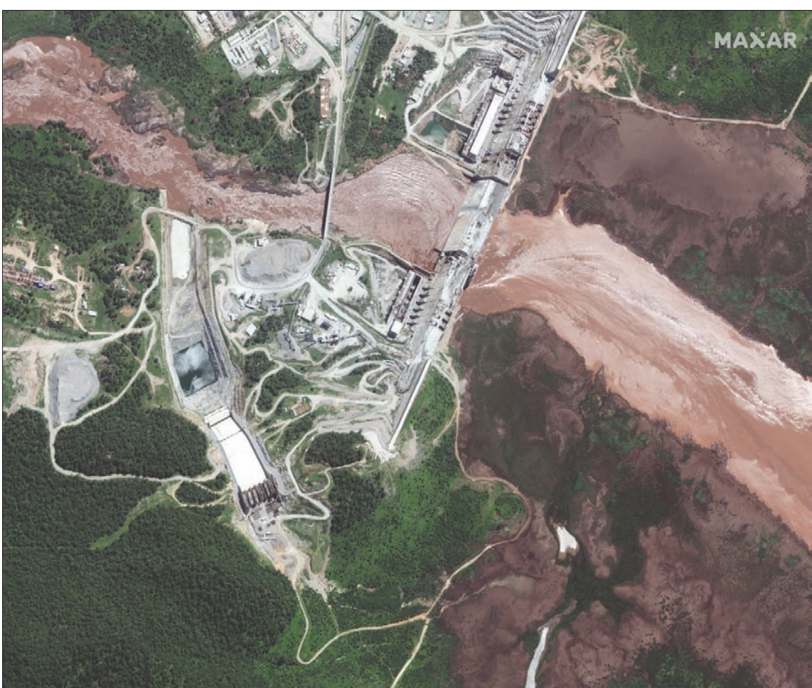
نشرت «أسوشيتد برس» الأميركية أمس صوراً جديدة بالأقمار الصناعية كشفت زيادة مياه الخزان الكامن وراء «سد النهضة»