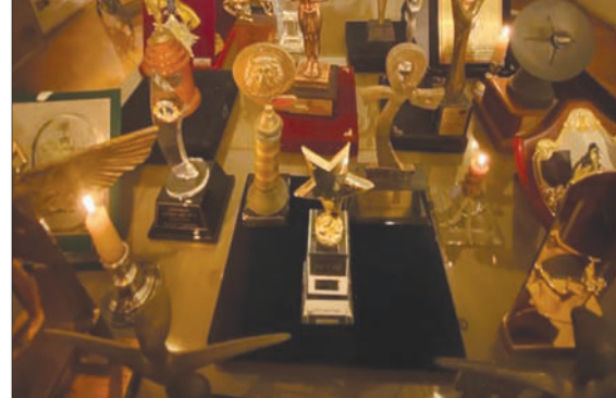
سميرة أحمد وسط جوائزها العديدة

وفي السينما كذلك جمع فيلم «البنات والصف» بينها وبين العندليب الأسمر عبد الحليم حافظ والنجمة سعاد حسني حيث ربطت بينهما صداقة كبيرة وكما تقول: «كان هذا العمل ثاني أفلام سعاد، وكان عبد الحليم يقف في الكواليس يراجع معها المشهد قبل التصوير ويوجهها لطريقة الأداء، وأذكر أنني لفتتها علاقة ساخنة ضمن مشاهد فيلم (غراميات امرأة) ومع عرض الفيلم فوجئت بالجمهور يسبني في الشارع ويقول لي: كيف تضربي سعاد حسني بهذه القسوة؟ ومن يومها قررت ألا أظهر في أدوار تنال من سعاد حسني؛ فقد كانت موهبة تملأ الدنيا حضورا وبهجة، ولم أصدق في أي وقت أنها أنتحرت».