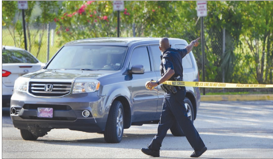
حارس مدرسة في فلوريدا يبعد متظاهرين عن مدخلها