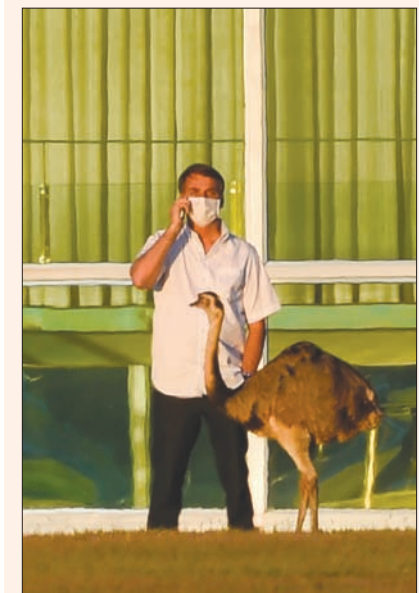
الرئيس البرازيلي جابر بولسونارو المصاب بـ«كورونا»

البرازيل، «الشرق الأوسط» أعلن الرئيس البرازيلي جابر بولسونارو الذي يخضع لحجر صحي منذ أسبوع بعدما أصيب بفيروس كورونا المستجد، أنه سيجري فحصاً جديداً ويتطلع لاستئناف أنشطته سريعا. وكان بولسونارو يتحدث خلال مقابلة مع شبكة «سي إن إن» البرازيلية عبر الهاتف من مقره الرسمي في برازيليا الإثنين، قصر الفورادا حيث يقضي فترة الحجر الصحي. وطبقاً لوكالة الصحافة الفرنسية، قال الرئيس الميمني المتطرف إنه سيخضع لفحص جديد، مضيفاً: «ساكون في انتظار النتيجة بفارغ الصبر لأنني لم أعد أحمّل هذا الروتين بالبقاء في المنزل، إنه أمر رهيب». وعدم بولسونارو (65 عاماً) منذ بدء انتشار وباء كوفيد - 19 إلى التقليل من شأن خطورته وعبر عن معارضته إجراءات العزل التي اتخذها حكام ولايات برازيلية، مشدداً على ضرورة عدم عرقلة نشاط الاقتصاد الوطني. وقال في المقابلة إنه يشعر أنه «في وضع جيد» وأنه لا يعاني من ارتفاع درجات الحرارة، ولا مشاكل تنفس وأنه لم يفقد أيضاً حاسة الشم، وهي إحدى العوارض الرئيسية للمرض. وأضاف: «إذا سار كل شيء على ما يرام الثلاثاء (أمس)، فسأعود إلى العمل وبالتأكيد في الحالة المعاكسة سأنتظر بضعة أيام إضافية». وتابع: «بالنسبة إلى بقية الأمور، كل شيء جيد، نعمل طوال الوقت عبر الدائرة التلفزيونية المغلقة ونقوم بكل ما هو ممكن لكيلا نترك الأمر خلال فترة وجودي في الفورادا». وكان أعلن الخميس الماضي على «فيسبوك» أنه شعر بتوسع وبدأ بتناول حبة من عقار هيدروكسي كلوروكين يومياً، وهو العقار المثير