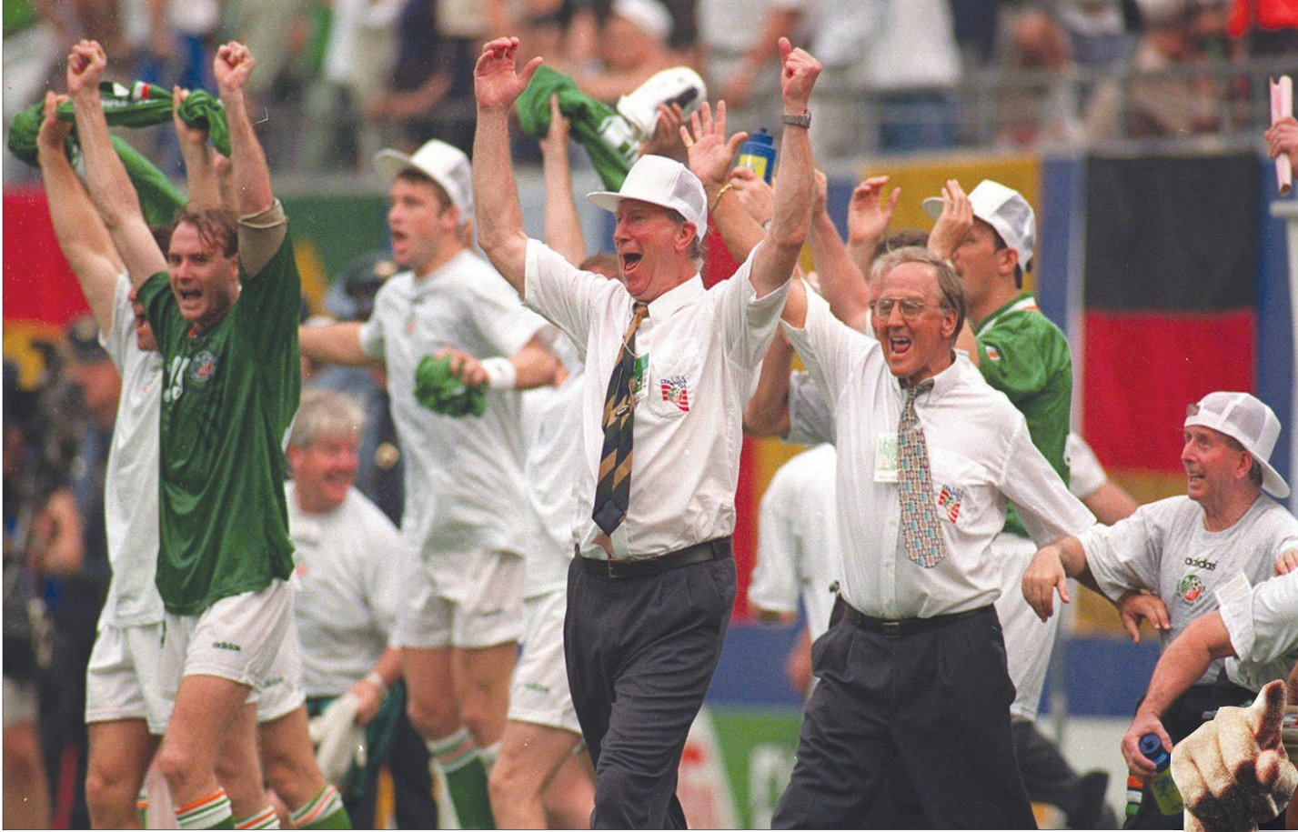
في نهائيات كأس العالم عام 1994 تمكن تشارلتون ولاعبوه من هزيمة المنتخب الإيطالي بهدف دون رد

ولم تفر أيرلندا في مباراة أخرى في كأس العالم 1994 بالولايات المتحدة الأمريكية. ورغم أن تشارلتون كان يعتمد على مجموعة مميزة من اللاعبين، فإنه كان يواجه مشكلة كبيرة في مركز حراسة المرمى، وهو الأمر الذي لم يمكنه من الذهاب بعيداً في المونديال. لقد كان تشارلتون يمني النفس بأن ينهي مسيرته مع المنتخب الأيرلندي بالتأهل إلى نهائيات كأس الأمم الأوروبية عام 1996 التي استضافتها إنجلترا، لكنه فشل في تحقيق ذلك بسبب تقدم أبرز اللاعبين المميزين في السن. وفي ظل عدم وجود لاعبين مميزين بعد اعتزال نجوم الجيل الذهبي للمنتخب الأيرلندي، باتت الطريقة التي يعتمد عليها تشارلتون تحقق نجاحاً أقل. وفي الحقيقة، لم يُظهر تشارلتون رغبة كبيرة في التغيير والتطور. وبعد الخسارة أمام هولندا في ديسمبر (كانون الأول) 1995، غنى المشجعون لتشارلتون كأنهم يودعون. وبالفعل رحل تشارلتون بعد عشر سنوات من العمل على رأس القيادة الفنية لمنتخب أيرلندا الجنوبية بعد مسيرة حافلة جعلته المعشوق الأول للجماهير الأيرلندية.