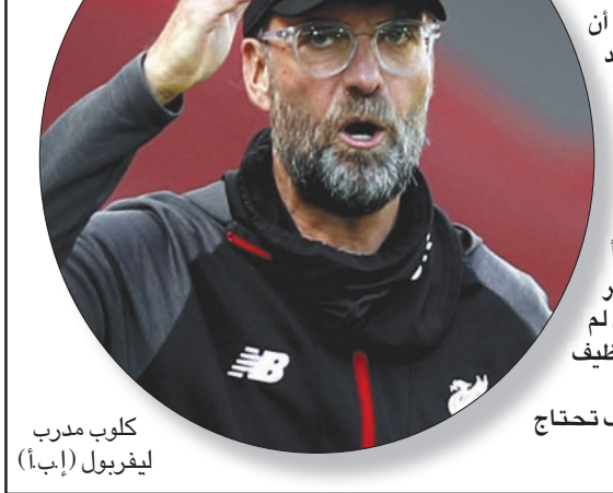
كلوب مدير ليفربول

حماية الفرق والمنافسة»، مشيراً إلى أنه لا يعرف تفاصيل حكم «كاس»، ومن ثم، فإنه لا يمكن أن يضيف تعليلاً آخر. وأكد كلوب أنه يتعين على جميع الفرق التمسك بالقواعد المالية التابعة لـ«يويفا»، وأوضح: «أتمنى استمرار قواعد اللعب المالي النظيف، فهي على الأقل تضع حدوداً، وهذا أمر جيد لكرة القدم»، ولفت إلى أنه سيكون من الصعب ألا تكون هناك لوائح على الإطلاق. وأشار كلوب إلى أن هناك شيئاً جديداً في الحكم الذي أتاح لسيتي المنافس لفريقه، اللعب دولياً خلال العامين المقبلين، «فعدنئذ لن تقل المباريات التي سيخوضها سيتي بمقدار 10 إلى 12 مباراة يمكن له خلالها أن يربح لاعبيه»، ثم قال مستبساً: «وعندئذ لن أرى فرصة لأي فريق آخر للفوز بالبطولة».