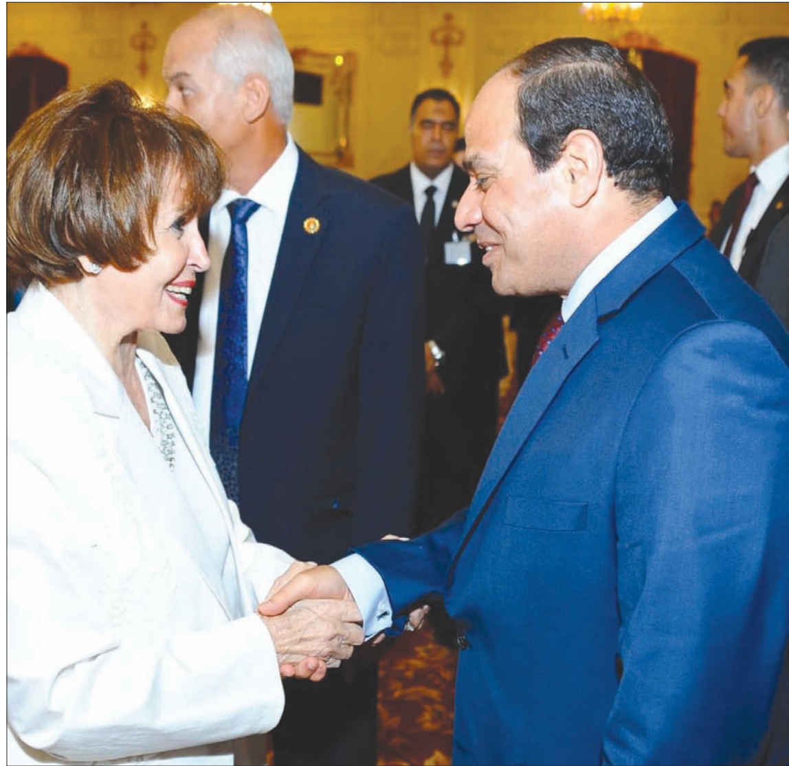
خلال تكريم الرئيس السيسي لها

أحمد متنوعة ومتعددة ولا تحوقف على التمثيل، إذ خاضت مجال الإنتاج السينمائي وقدمت أعمالاً جريئة لم تكن من بين أبطالها، ومن بين الأفلام التي أنتجتها فيلم البريء للمخرج عاطف الطيب الذي أثار ضجة كبيرة وتعرض للمنع لولا تدخل جهات سيادية وتروي تجربتها مع الفيلم قائلة: «كان الفيلم جريئاً ويدين بعض الجهات الأمنية، وشاهد المشير الراحل عبد الحليم أبو غزالة وزير الدفاع حينها، وساند الفيلم الذي قوبل بفضافة كبيرة من الجمهور والنقاد وشعرت بالفخر لإنتاجي هذا الفيلم الذي كتبه وحيد حامد».