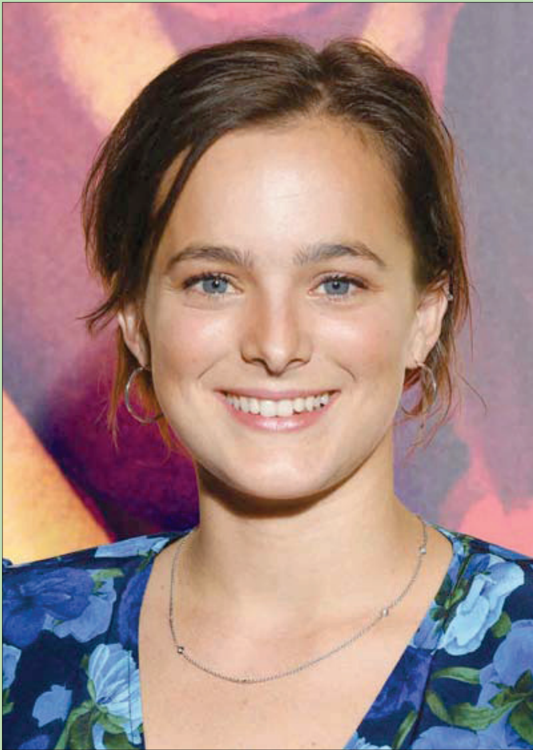
الممثلة فيليبين فيلج تحضر تصوير فيلم «إتي سومير 85» في باريس