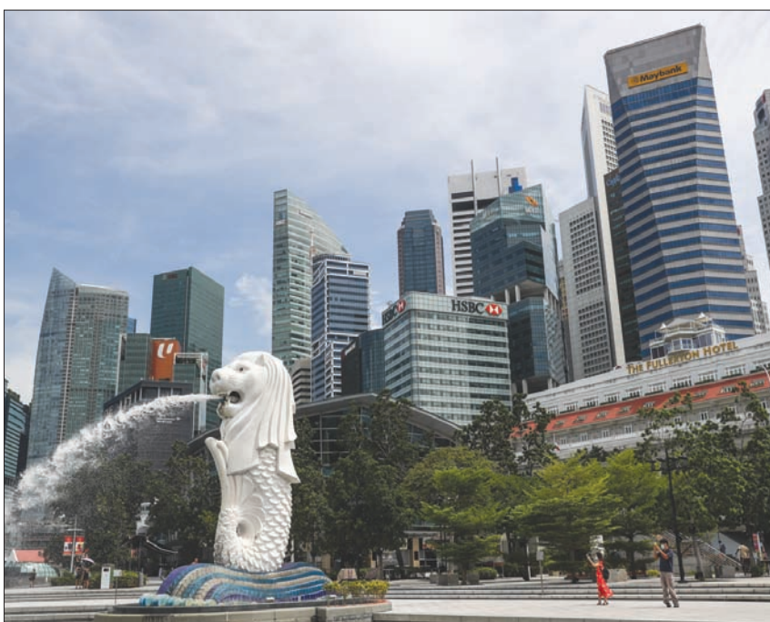
دخلت سنغافورة رسمياً في ركود في الفصل الثاني مع تراجع النشاط الاقتصادي 41,2 % (إ.ب.أ)

وفي بداية الأزمة، قال رئيس الوزراء السنغافوري، لي هسين لونغ، في شهر فبراير الماضي إن التأثير الناجم عن كورونا على اقتصاد بلاده يتجاوز تأثير متلازمة الإلتهاب الرئوي الحاد (سارس) الذي نشفي عام 2003. لافتاً إلى إمكانية حدوث ركود اقتصادي. كما أشار إلى أن اقتصادات المنطقة مترابطة بشكل كبير.