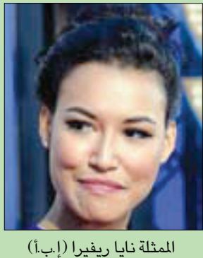
الممثلة نايا ريفيرا

ولم تظهر ريفيرا منذ، فاطلقت السلطات في اليوم نفسه عملية بحث واسعة عنها بمشاركة عدد كبير من الغواصين، معرزين بالروحيات. وقد عُثر بعد ساعات على الطفل في القارب «لائمًا ومتردياً سترة نجاة»، وفق ما أفادت الشرطة. وقال نجل الممثلة، إنه والوالدته كانا يسبحان في البحيرة، وأنها ساعدته للصعود مجدداً إلى القارب، وعندما استدار، رآها «تحتفي تحت الماء»، وفق ما روى قائد الشرطة بيل أيوب.