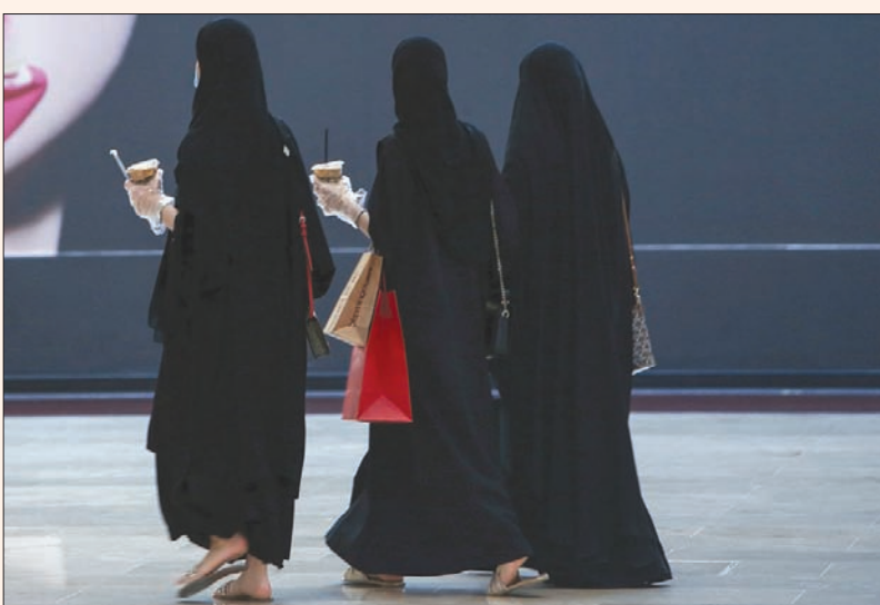
متسوقون في أحد مراكز التسوق في الكويت الأسبوع الماضي

«كوفيد - 19»، كما يعتمد نظام التشخيص في الجهاز المبكر في الإمارات الذكاء الصناعي المتقدم في تحليل الصور، وفقاً لمقياس دقيق جداً، ما يمكنه من فحص مجموعات كبيرة من الأفراد في الوقت نفسه.