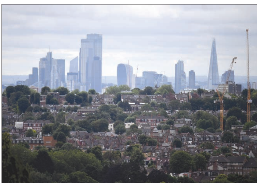
تزداد مخاوف حي المال والأعمال في العاصمة البريطانية خصوصاً مع ما يبدو ارتباكاً في الرسالة الحكومية الخاصة بالعودة إلى العمل (إ.ب.أ)

وفي غضون ذلك، أشار تحقيق لصحيفة «إيفينغ ستاندر» البريطانية إلى أن العاصمة لندن وحي المال وسطها يعانيان أكبر أزمة اقتصادية خلال أجيال، حيث سيقدّم عشرات الآلاف وظائفهم، كما يواجه مئات الشركات خطر الانتقال من بريطانيا، فقد فرغت الشوارع التي كانت تفتح بالسكان من حي ماي فير إلى غرب لندن إلى دوكلاندز شرق العاصمة من السياح والمسافرين بسبب الضربة المزدوجة للمدمرة التي تلقته البلاد. ونقلت الصحيفة عن أصحاب الأعمال «المذعورين» القول إن نحو 50 ألف وظيفة في القطاعات التي تعاني أساسا، مثل قطاع التجزئة والسياحة، ستختفي في الحي التجاري في