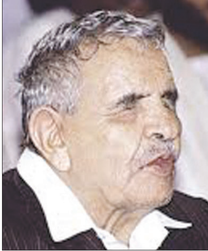
عبد الله البردوني