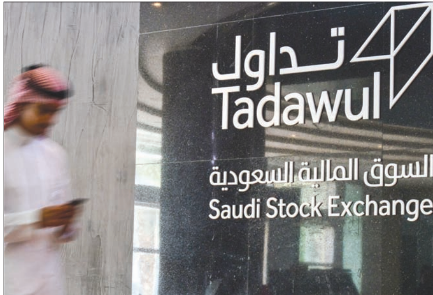
السوق المالية السعودية تتطور سريعاً بتقديم المنتجات وخدمات الاستثمار المالي

وأضاف الحصان: «يعتبر إطلاق سوق المشتقات المالية في السعودية خطوة مهمة لتقديم منتجات متطورة في السوق وإيجاد بيئة استثمارية جاذبة لكل من المحترفين والمتحويين المحليين والدوليين على حد سواء