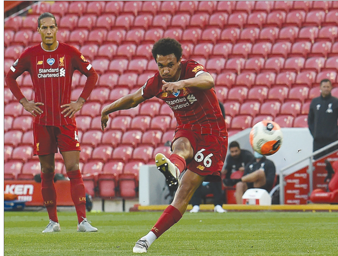
في فريق ليفربول الحالي يلعب المدافعون أحياناً كمهاجمين والعكس صحيح

ورغم أن معظم هؤلاء اللاعبين جاءوا إلى ليفربول وهم ليسوا نجوم عالميين من العيار الثقيل فقد تم تطوير قدراتهم وإمكاناتهم بشكل رائع وتحولوا فيما بعد لنجوم لاعبين في سماء كرة القدم العالمية، وقادوا النادي للحصول على لقب دوري أبطال أوروبا، بالإضافة إلى إعادة درج الدوري الإنجليزي الممتاز إلى خرائط النادي بعد 30 عاماً. لكن الشيء الملاحظ هو أن المدير الفني الألماني أن كتيبة الريزنجز، يورغن كلوب، يعتمد على خطة تكتيكية تجعله يتفوق على جميع المنافسين، وهي أن تظهر في الجنب (تريبتن الكسندر