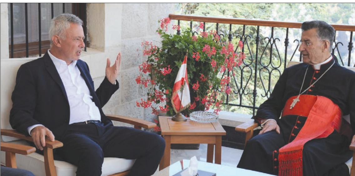
البرطريك الراعي مستقبلاً النائب السابق سليمان فرنجية أمس