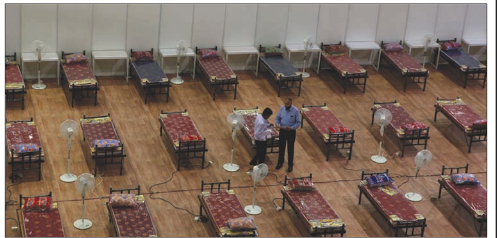
عزل بنغالور بعد تسجيلها 20 ألف إصابة بـ«كورونا» (إب.أ)

فرضت الهند إجراءات العزل العام مجدداً على بنغالور، مركز التكنولوجيا الحديثة في البلاد، لمدة أسبوع اعتباراً من أمس (الثلاثاء)، بعد ارتفاع حالات الإصابة بفيروس «كورونا المستجد» مما يعطل جهود الحكومة لإنعاش الاقتصاد. وزادت الحالات من نحو 1000 في 19 يونيو (حزيران)، حين اعتقدت المدينة أنها نجت من أسوأ مصير بفضل تتبع المصابين والمخالطين