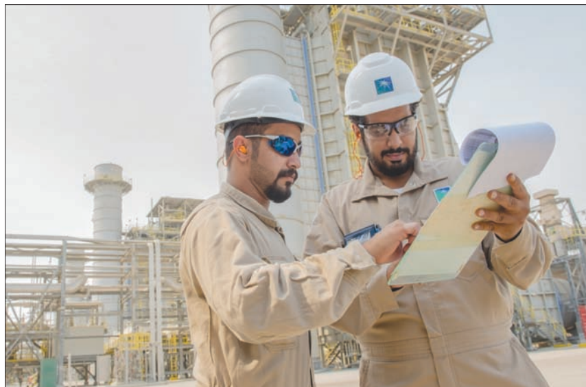
أرامكو السعودية تقوم بخطوات التكامل الاستراتيجي من خلال تنظيم قطاعاتها الداخلية (الشرق الأوسط)