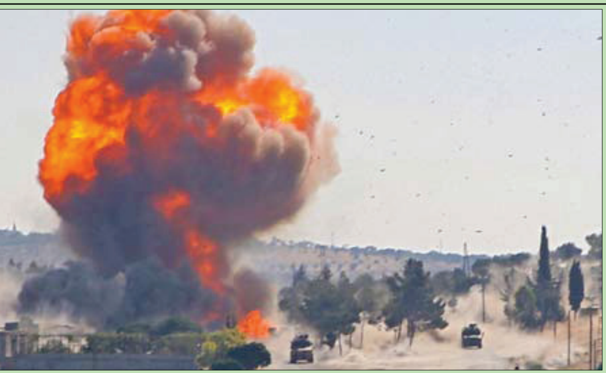
أعمدة دخان تتصاعد بعد تفجير استهدف دورية تركية - روسية قرب مدينة أريحا شمال غربي سوريا أمس