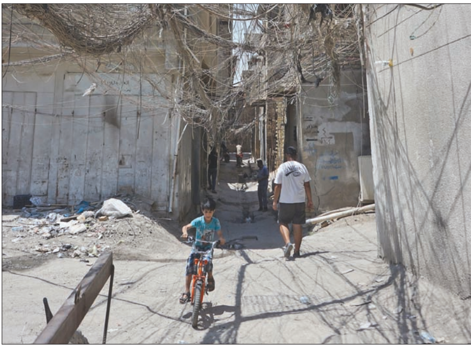
أسلاك كهربائية ممددة عشوائياً في ضاحية سيد سلطان علي بالعاصمة العراقية بغداد أول من أمس