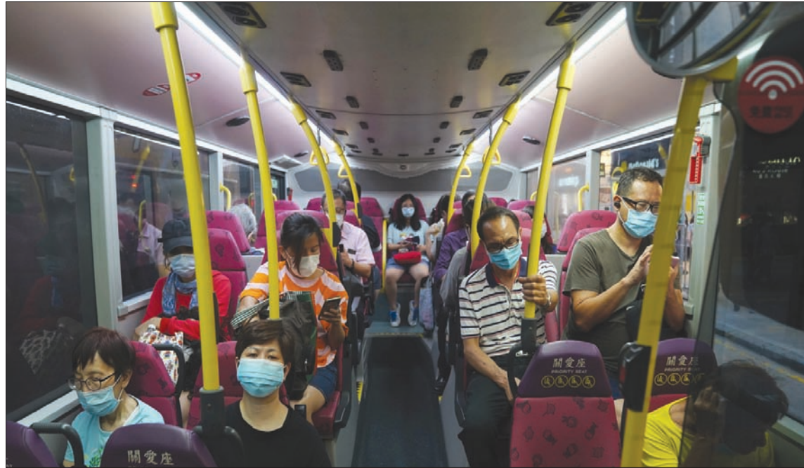
ركاب مقفون في أحد قطارات هونغ كونغ

عواصم: «الشرق الأوسط» عسادت دول آسيوية وأستراليا إلى تشديد القيود نتيجة تسجيلها إصابات جديدة بفيروس «كورونا»، فيما بلغ عدد إصابات فيروس «كورونا» بأحاء العالم، وفقاً لإحصاء لـ «رويترز»، 13 مليوناً الاثنين بزيادة مليون حالة عما كان عليه قبل خمسة أيام فقط. وأودت الجائحة بحياة أكثر من نصف مليون شخص خلال ستة أشهر ونصف الشهر. وشددت الولايات الأسترالية الرقابة على الحدود وقيدت ارتياد الحانات أمس (الثلاثاء)، فيما استعدت ديزني لإغلاق منتزه العباها في هونغ كونغ، وكففت اليابان من عمليات التتبع لمواجهة قفزة في حالات الإصابة بفيروس «كورونا» بانحاء قارة آسيا، مما أوجح مخاوف من موجة تفش ثانية.