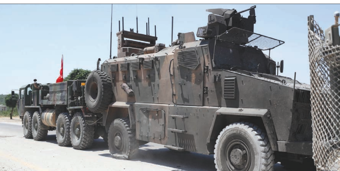
عربة تركية تسحب مدرعة تعرضت لأضرار بعد تفجير استهدفها على طريق حلب - اللاذقية أمس