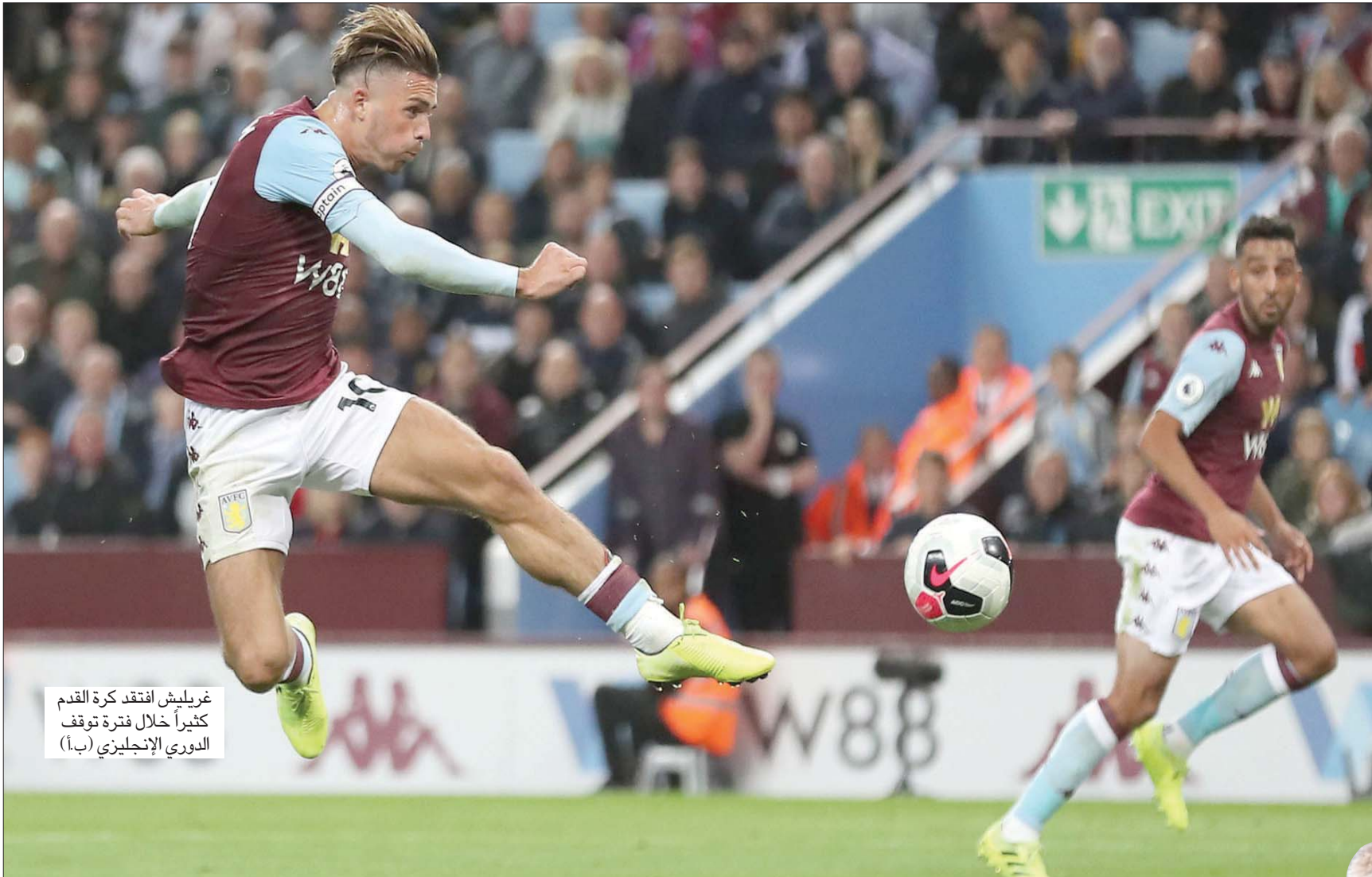
غريليش افتقد كرة القدم كثيراً خلال فترة توقف الدوري الإنجليزي