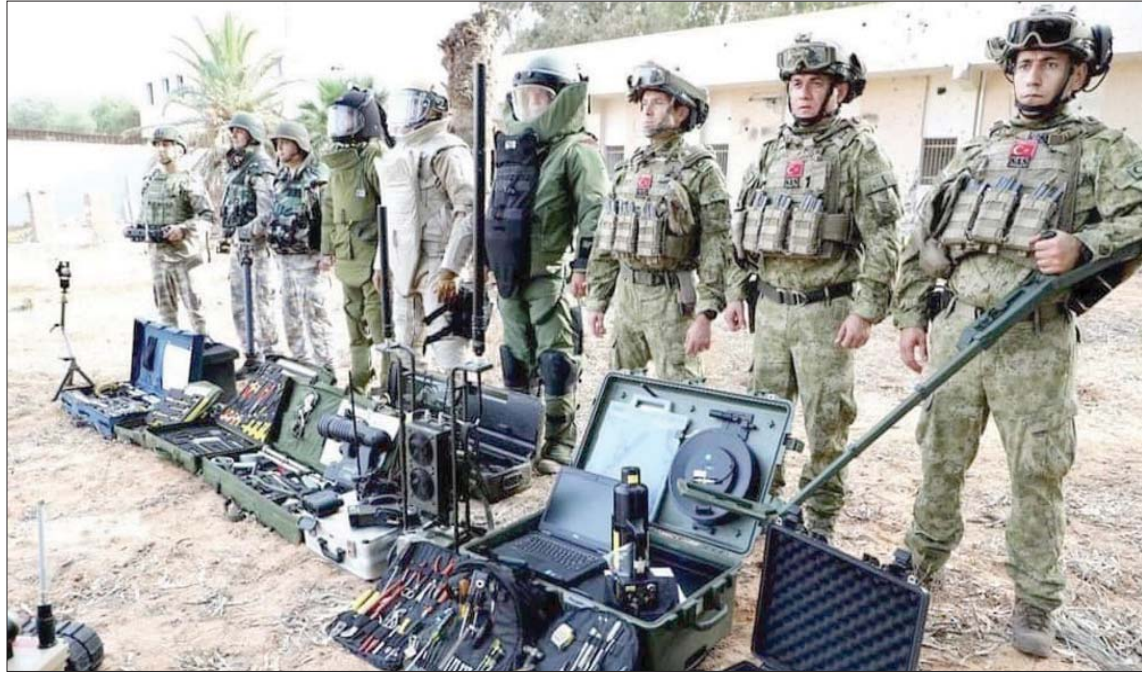
خبراء الغام أتراك في العاصمة الليبية

تحصل على ضمانات من المجتمع الدولي بان دخل النفط سيذهب إلى مكان آمن، فستتم تسوية الأمور، لكن ليست لدينا مصلحة في استمرار غلق النفط، نافيًا وجود خلاف مع المشير حفتر في هذا الخصوص.