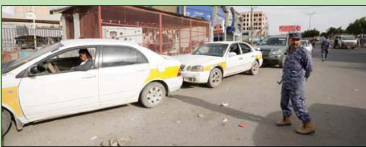
طابور قرب إحدى محطات «البنزين» بعد عودة أزمة الوقود إلى صنعاء حديثاً

الحرب أوزارها، وتم إزالة الفكر النازي من رؤوس الألمان واعدوا دمجهم في المجتمع الأوروبي، فكانت محاكمات نورنبرغ الشهيرة، حيث سنت قوانين تجريم النازية أو المبادئ بأفكارها، أو حتى تقليد حركاتها وإشارات الرمزية».