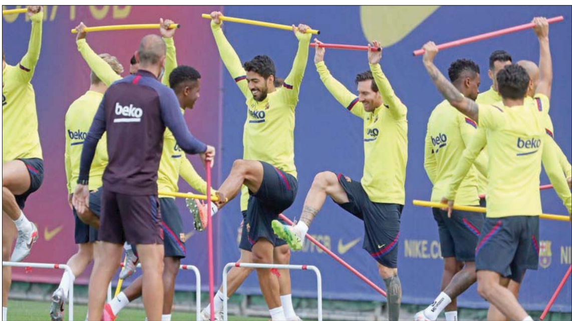
برشلونة يسعى إلى التثبيت بصدارة الدوري الإسباني

الذي يديره المدير الفني جولن لوبيتيغي، مع ريال بيتيس، في مباراة ديربي الأندلس. وقد تغلب إشبيلية (2-صفر) على غريمه وضيفه ريال بيتيس بفضل ركلة جزاء مثيرة للجدل، ولحظة مذهلة من الجناح الأرجنتيني لوكاس أوكامبوس الذي رد القائم محاولة لريال بيتيس ليهز الشباك بعد ذلك مستحقاً في الدقيقة 56 من ركلة جزاء قاسية عقب تدخل لوبيتيغي، وهو ما يفتح المجال أمامه للمشاركة في المباريات قبل ختام بطولة الدوري في 27 يونيو (حزيران) الحالي.