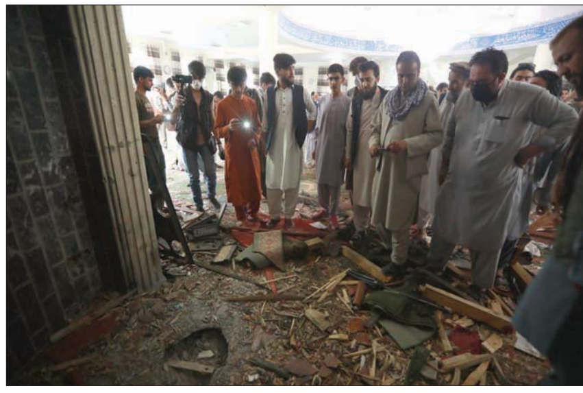
مواطنون يعاينون الدمار الذي لحق بأحد المساجد في كابل بعد انفجار قنبلة أمس