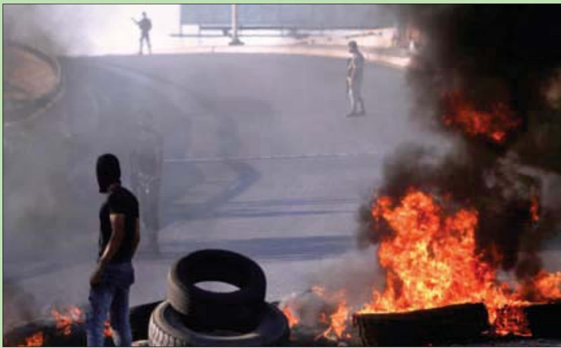
جنود ينتشرون بعد محاولة محتجين غلق جسر بإطارات محترقة على طريق صيدا - الغازية جنوب لبنان أمس

حاول لبنان تطويق ارتفاع سعر الدولار، وغضب الشارع اللبناني على خلفية تدهور سعر الليرة اللبنانية، عبر إجراءات سياسية ومالية، توزعت بين التلميح بأنه لا إقالة لحاكم مصرف لبنان رياض سلامة، وبيع الدولار في السوق لتهدئة الطلب عليه، وبإجراءات قضائية وأمنية، في وقت رسم الرئيس اللبناني ميشال عون شبكات حول أسباب الارتفاع المفاجئ لسعر الصرف، قائلاً إنها «تبع صفة العفوية عنها»، متحدثاً عن «مخطط مرسوم نحن مدعوون للتكاتف لمواجهة».