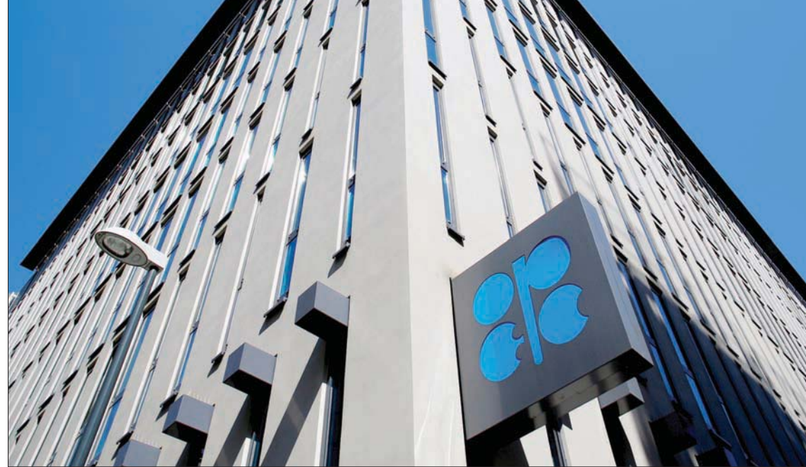
أكدت مصادر أن اجتماع لجنة تقودها «أوبك» سيستعرض الأسبوع المقبل وضع سوق النفط والتعاون في خفض قياسي للإمدادات (رويترز)

في غضون ذلك، قالت خمسة مصادر بـ«أوبك+» إن اجتماع لجنة تقودها «أوبك» سيقوم باستعراض وضع سوق النفط الأسبوع القادم، سيؤدي النصح لمجموعة «أوبك+» وقال أحد المصادر بـ«أوبك+» والذي طلب عدم نشر اسمه: «إنها لجنة استشارية يمكنها أن تقدم توصيات». واللجنة مؤلفة من أعضاء «أوبك»: السعودية والإمارات والجزائر والكويت وفنزويلا وبنجيريا والعراق، علاوة على روسيا وكازاخستان وهما من خارج «أوبك». وأحد المصادر التي ستخضع فيها اللجنة سيكون ما إذا كان مقدور الدول التي لم تنفذ حصتها من الخفض فعل المزيد. وطالبت «أوبك+» يوم السبت دولاً مثل بنجيريا والعراق بالتعويض عبر القيام بتخفيضات إضافية في الفترة من يوليو إلى سبتمبر (أيلول). وفي اليوم السابق على اجتماع لجنة المراقبة الزبانية المشتركة، ستجتمع مجموعة أدنى مستوى يُطلق عليها اللجنة الفنية المشتركة. وسيعقد الاجتماع عبر الإنترنت على غرار المحادثات الزبانية التي عُقدت يوم السبت.