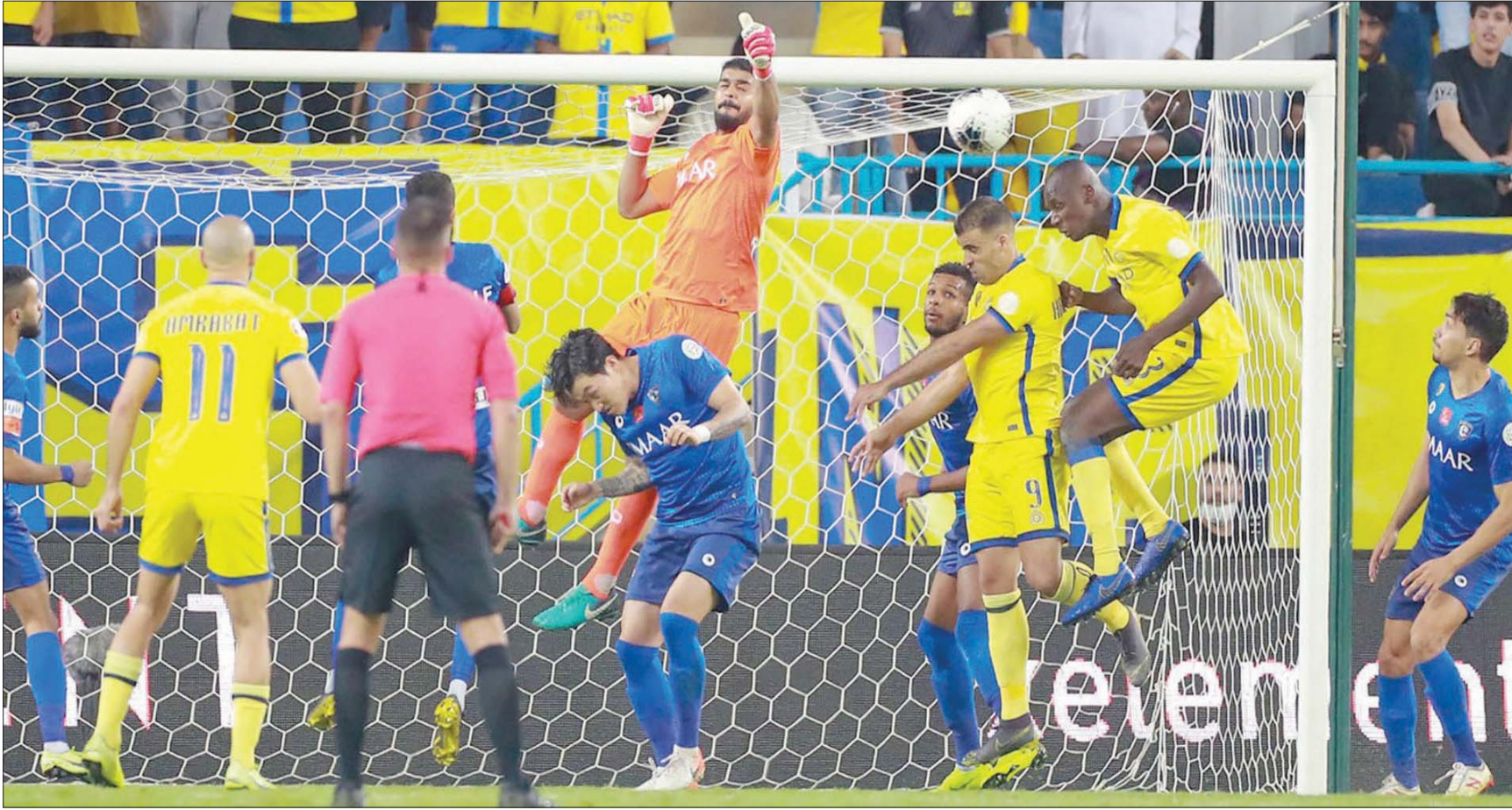
ديربي الهلال والنصر سيبدئ عودة دوري المحترفين السعودي