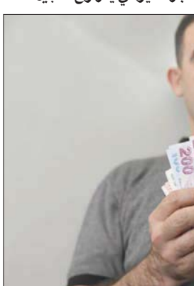
شاب يحمل أوراقاً نقدية تركية في شمال سوريا

والكهربائية بالعملة الوطنية بقيمة 1200 ليرة سورية للدولار الواحد، وفي ساعات المساء من اليوم ذاته، ذهب إلى أحد محال الصرافة ليجازاً يتراجع قيمة الليرة، حيث وصل سعرها لنحو 3 آلاف ليرة سورية مقابل الدولار الواحد.