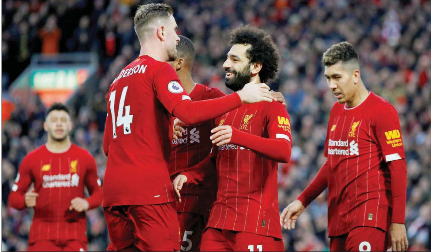
لاعب ليفربول متعشون لاستئناف الدوري الإنجليزي

وفي اليوم الذي تم فيه تحديد موعد 17 يونيو (حزيران) لاستئناف البريميرليغ، قال وزير الرياضة أوليفر دون إن لكرة القدم «مكانة خاصة في حياتنا الوطنية»، إلا أن الدوري الممتاز لم يحظ بهذا الدعم السياسي الكبير طوال فترة تفشي الوباء. ففي أوائل شهر أبريل (نيسان) الماضي، عندما اصطدمت الأندية بالسقوط المفاجئ للإيرادات، كان ليفربول وتوتنهام من بين الأندية التي أعلنت عن وضع موظفيها في البطالة الجزئية، وعن نيتهما استخدام المال العام لدفع رواتب موظفيهم من غير اللاعبين، والاستفادة من خطة الدعم التي وضعتها الحكومة البريطانية في ظل أزمة «كوفيد-19».