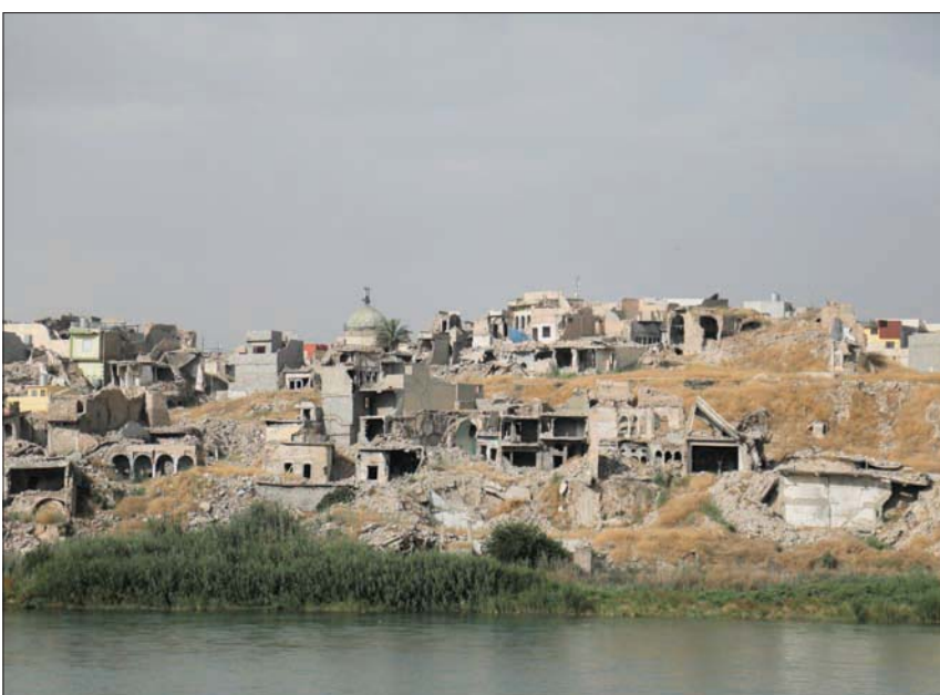
الموصل القديمة لا تزال في قبضة الخراب بعد ثلاثة أعوام على تحريرها من «داعش»