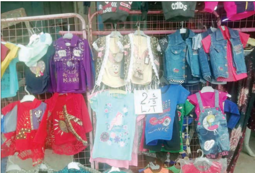
البسة أطفال مسعرة بالليرة التركية في إدلب (الشرق الأوسط)

وحينها المصادر أن «المركزي» حاول أن يستيق عقوبات «قانون قبض» الأميركي بإصدار لائحة تنظيمية لتنظيم عمل الشركات المتعاقدة معه، تشدد على ضرورة أن يكون الملاك متمتعين بالجنسية السورية، وأن تكون أصول الشركة موجودة في سوريا كي لا تشملها العقوبات.