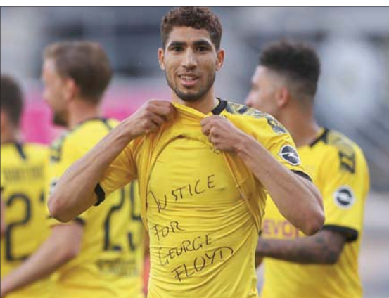
المغربي أشرف حكيمي قد يعود إلى ريال مدريد

وأضاف فافر: «نحن سعداء لأن ماركو يتدرب معنا مرة أخرى، ولكننا نأمل في أن يتمكن من اللعب في أقرب وقت ممكن. لسوء الحظ، لا يمكننا إعطاء توقعات أكثر دقة حتى الآن». وتبدو الأمور أفضل بالنسبة للمهاجم النرويجي إيرلينج هالاند الذي تم استبعاده في آخر مباراتين لدورتموند، ولكن ما زال بإمكانه الظهور مجدداً مع الفريق، صاحب المركز الثاني في ترتيب المنافسة الذي ما زال يحتل