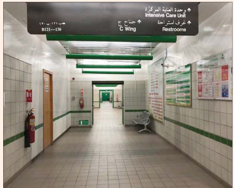
70 سريراً للعناية المركزة أصبحت اليوم شبه خالية

وأودت وزارة الصحة السعودية أكثر من 200 ممارس صحي للمستشفى من مستشفيات خاصة، بغرض تشغيل 70 سريراً للعناية المركزة لعلاج المصابين بفيروس «كوفيد - 19»، وذلك ضمن خطة الوزارة لخصخصة وتعزيز طواقم أجنحة العناية المركزة. ويعمل المختبر في المستشفى على نوعين من الإجراءات؛ أولها رفع عينات المصابين على نظام «حصن» الذي يهدف إلى إدارة الأوبئة عبر شبكة إلكترونية متصلة مع الوزارة مباشرة، وذلك لحصر أعداد المرضى. أما الإجراء الثاني فهو عمل الفحوصات الشاملة للمصاب، مثل تحديد وظائف الكلى والكبد وأنزيمات القلب ومستوى الجلوكوز بالدم ونسبة العدوى. يذكر أن هذه المنظومة من الأقسام المتخصصة في مستشفى «أحد العام» كانت لها تجربة سابقة، حيث كان المستشفى مركزاً لعلاج متلازمة الشرق الأوسط التنفسية «ميرس»، ما جعله على استعداد في حال حدوث أي انتشار لمرض مشابه، حتى ظهر «كورونا المستجد» مطلع مارس (آذار) الماضي في المدينة المنورة.