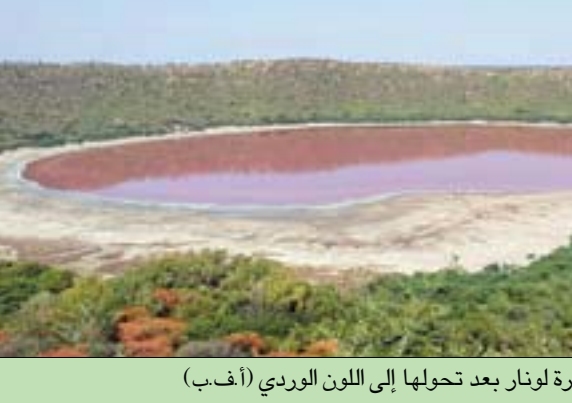
مشهد عام لبحيرة لونا بعد تحولها إلى اللون الوردى

يجرى التحقيقات حالياً فيما إذا كان وجود الطحالب الحمراء بكثرة له أثره في تغير لون مياه البحيرة على النحو المشهود. وقالت إنهم سوف يرسلون العينات لتحليلها لدى الكثير من المختبرات، وبمجرد دراستها سوف تتمكن من تحديد السبب الحقيقي في تحول مياه البحيرة إلى اللون الأحمر بصورة نهائية. وكانت تلك البحيرة، التي تتواجد على مسافة 500 كيلومتر إلى الشرق من مدينة موباي، قد تكونت إثر اصطدام أحد النيازك بكوكب الأرض قبل نحو 50 ألف عام مضت، وذلك وفقاً لشبكة «سي إن إن» الإخبارية. وتعتبر تلك البحيرة من المعالم المعروفة والجاذبة للسياح في الهند، ولقد خضعت أيضاً لدراسات مختلف العلماء من حول العالم.