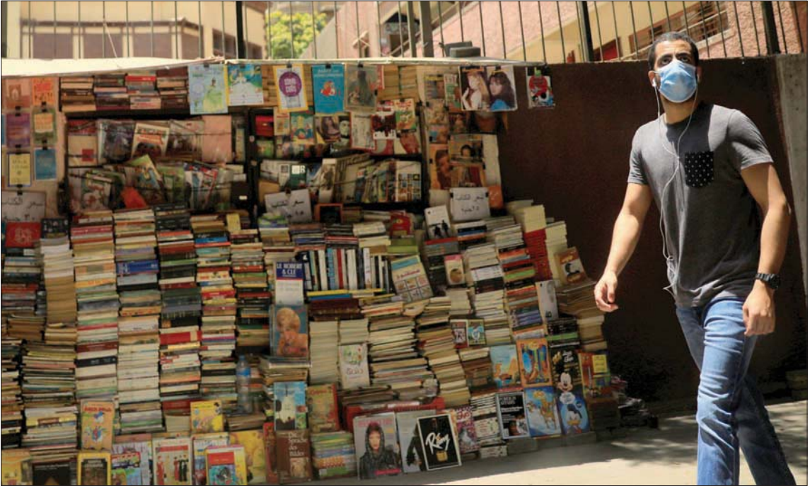
شاب يتجول في أحد شوارع القاهرة بفتاح واق أس

في وقت ترهن الحكومة مصرية تراجع إصابات «كورونا المستجد» بـ«الالتزام بالإجراءات الاحترازية وارتداء الكمامات»، أكد المركز الإعلامي لمجلس الوزراء المصري «جاهزية المستشفيات لاستقبال الحالات الطارئة»، نافية «بيع بلازما المتعافين من (كورونا)» بمقابل مادي، وانسحاب المستشفيات الخاصة من علاج مصابي الفيروس، وتوقف المستشفيات الحكومية عن استقبال الحالات الطارئة لانشغالها بـ(أزمة كورونا)». وأعلنت مصر أخيراً قرارات متعلقة بخطة «التعايش مع كورونا» والتي تضمنت «تقليص ساعات (حظر التنقل)، ودراسة فتح دور العبادة اعتباراً من أول يوليو (تموز) المقبل مبدئياً، والإعلان أول يوليو عن بدء حركة السياحة الوافدة والطيران إلى المحافظات السياحية الأقل إصابة بالفيروس».