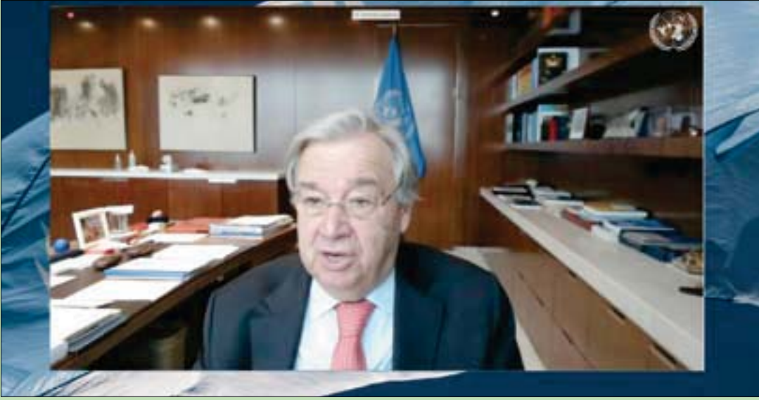
غوتيريش خلال أحد اللقاءات الافتراضية

وقدرت الأمانة العامة أن «الطائرات المجهزة و-أو أجزاء منها المستخدمة في الهجمات على المملكة العربية السعودية كانت من أصل إيراني». وقال: «تُظهر المحركات التي عُثر عليها في هذه الطائرات المجهزة أوجه تشابه مع محرك إيراني (يُسمى «شاهاد 783»)، عرضه إيران في معرض عسكري في مايو 2014»، كما أن «الجيروسكوبات وبعض المحركات التي زُعمت من الحطام متشابهة مع الجيروسكوب والمحرك الذي شوهد في طائرة إيرانية مسيّرة عُثر عليها في أفغانستان عام 2016»، وبالإضافة إلى ذلك، جرى تصدير أحد ملفات الإشعال التي زُعمت من الهجمات، إلى إيران عام 2016.