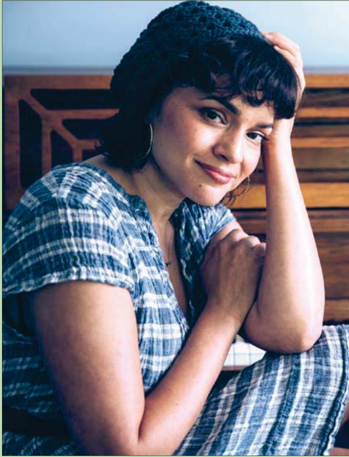
المغنية الأميركية نورا جونز في لحظة ترويجية بمناسبة إصدار ألبومها الجديد

ليس صحيحاً أن النساء شر لا بد منه - وأبصم على ذلك بالعشرة.