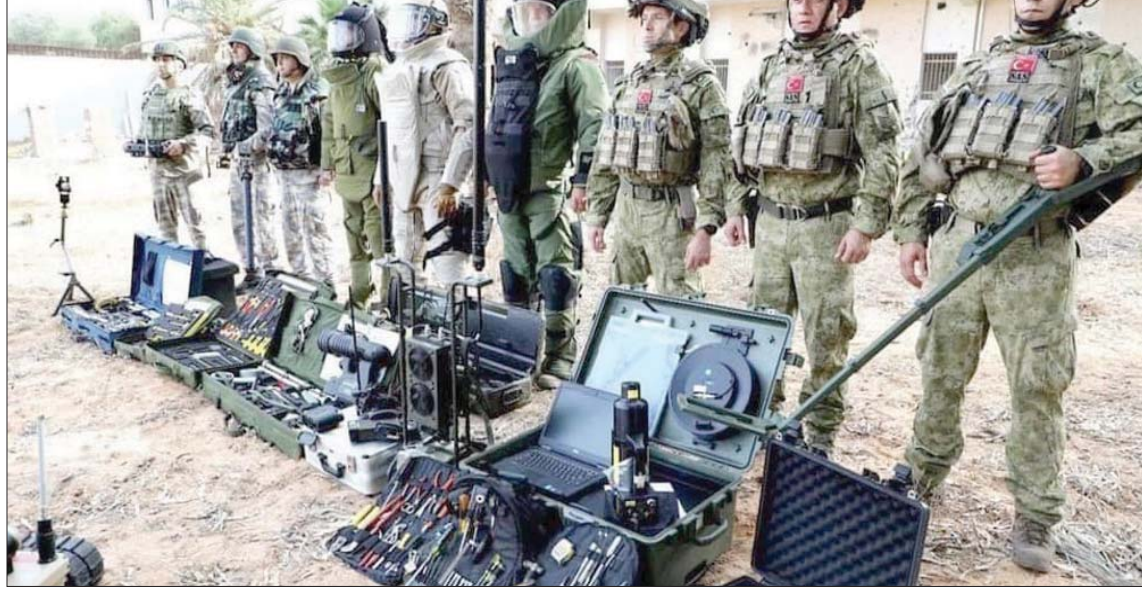
خبراء الغام أتراك في العاصمة الليبية (قوات الوفاق)

وقال موقع «إيتاميل رادار» المتخصص في رصد حركة الطيران العسكري، إنه رصد أول من أمس مهمة جديدة للقوات الجوية التركية. فيما أكد موقع «فلايت رادار 24» الإيطالي، المعلومات ذاتها، مشيراً إلى اقتراب 3 طائرات شحن عسكرية تركية، وسفينة على متنها 111 مسلحة من أجواء غرب ليبيا. مبرزاً أن طائرتين