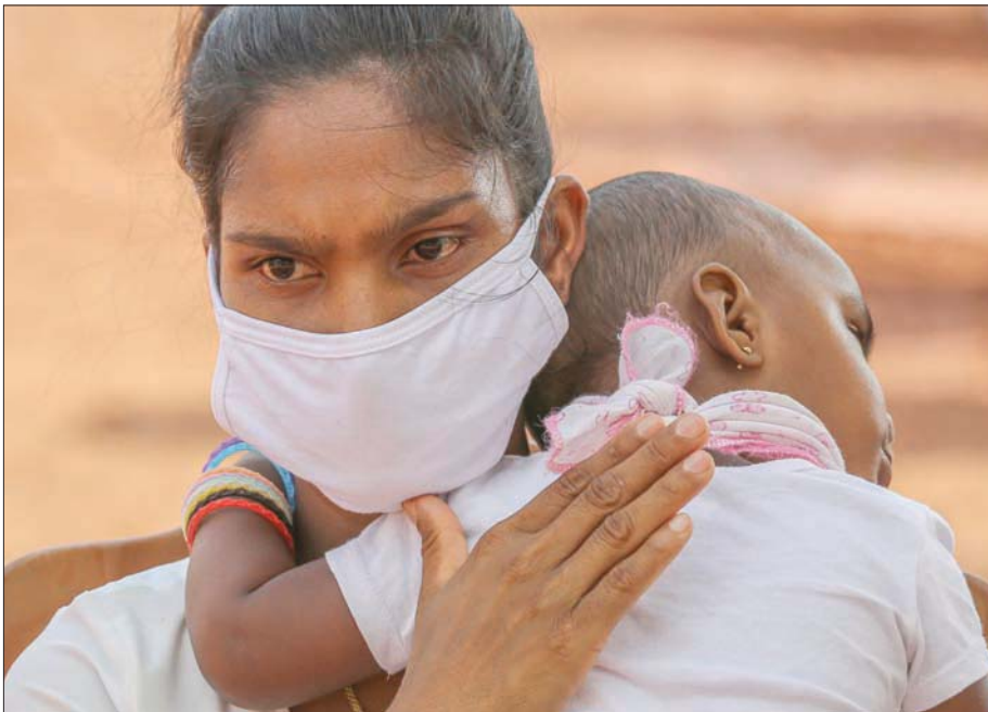
أم وطفلها ينتظران العودة إلى بلدتهما بعد تخفيف إجراءات «كورونا» في سريلانكا

ويشير التقرير إلى أن الأزمة ستتسبب على الأرجح بزيادة كبيرة في معدلات الفقر. وبحسب البنك الدولي، فإن عدد الأشخاص الذين يعيشون في فقر مدقع يمكن أن يرتفع بشكل حاد بما يصل إلى 60 مليون شخص هذا العام وحده. وقال رئيس منظمة العمل الدولية، غاي رايدر: «فيما يقضي الوباء على مداخيل العائلات، فقد يلجأ العديد منها إلى عمالة الأطفال ما لم تحصل على مساعدة». والعلاقة بين زيادة الفقر وارتفاع أعداد الأطفال العمال تبدو واضحة، بحسب التقرير الذي أشار إلى دراسات في عدد من الدول تظهر أن زيادة بنسبة