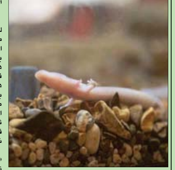
التنين الرضيع (أ.ب.ف)

القاهرة، حازم بدر «التنين» كائن أسطوري صيني، لكن التشابه في الشكل المتداول له مع «سمندل الكهوف الأوروبي» التابع لطائفة البرمائيات، هو ما يجعل البعض يسمي الأخير باسم هذا الكائن الصيني، الذي استخدم في الإعلان عن تجربة ناجحة لتربية هذا الحيوان النادر بكهف بوسطينا بسلوفينيا. وأعلن مسؤولو الكهف مساء أول من أمس، أنهم «بدأوا في السماح فقط لـ 30 زائراً يومياً لزيارة ثلاثة من التنانين الرضيع» التي ولدت في عام 2016 ضمن مشروع تربية ناجح بدأ في عام 2016. وقالت إدارة الكهف في بيان: «فخورون بتقديم ثلاثة من أصل 21 تنيناً رضيعاً، نراقبها عن كثب منذ عام 2016 عندما وضع أحد حيوانات