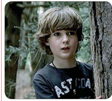
مشهد من «البانس»

سواها أن الوضع بعد بلوغ «كورونا» ذروته ليس كما قبله. الجمهور العريض منقسم حيال كل شيء في هذا الخصوص