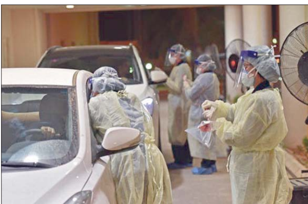
إجراءات فحص السكان في السيارات شمال الرياض

ويؤكد أطباء مختصون أن هناك احتمالية لإصابة بالفيروس والشفاء منه دون علاج أو حتى ملاحظة ذلك، وهو ما يرجح إلى أن هناك نسبة من الأشخاص يصابون