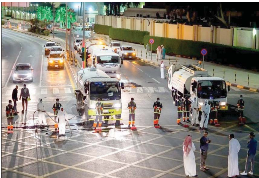
جزء من عمليات الإصحاح البيئي في السعودية