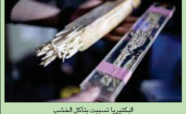
البكتيريا تسببت بتآكل الخشب

القاهرة، حازم بدر تسببت دودة السفن في تدمير سفن المستكشف كريستوفر كولومبوس في جامايكا، وأسقطت أسطول أرمادا الإسباني، وتسببت في انهيار أرضة ميناء سان فرانسيسكو، وطالما كان البشر يضعون هياكل خشبية في المحيط، فإنها كانت تدمرها. هذه المشكلة التي كانت تمثل تحدياً كبيراً في عصر القوارب الخشبية، يقف خلفها شريك في الجريمة، وهو البكتيريا «تيريديني باكتر واتييري»، والتي من دونها لم تكن تمتلك الديدان تلك القدرة التدميرية، لكن باحثين من جامعة تورنتو إيسترن الأميركية، نجحوا مؤخراً في تبييض وجه تلك البكتيريا باكتشاف فوائد لها تم الإعلان عنها في العدد الأخير من «المجلة الدولية لعلم الأحياء الدقيقة المنهجي والتطوري». يقول دان ديستيل، مدير مركز تراث المحيط الجينومي في الجامعة، ورئيس الفريق