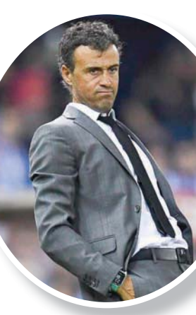
لويس إنريكي (الشرق الأوسط)

اللعب دونهم، وأمل في عودتهم قريباً إلى الملاعب». ويتصدّر برشلونة، حامل اللقب في آخر موسمين، ترتيب الدوري الإسباني بفارق نقطتين عن غريمه التقليدي ريال مدريد. وأضاف المدير الفني دي يونغ: «في البداية لم يكن سيئاً أن نتدرب بمفردين؛ لأن الجميع اعتاد على التقدم بحسب إيقاعه. تدربت في هولندا كي أتأكد من الوصول إلى هذه المرحلة هنا. أنا سعيد للاندماج مجدداً مع المستطيل الأخضر». وسحمت السلطات الإسبانية بالانتقال من التمارين الفردية إلى تدريبات