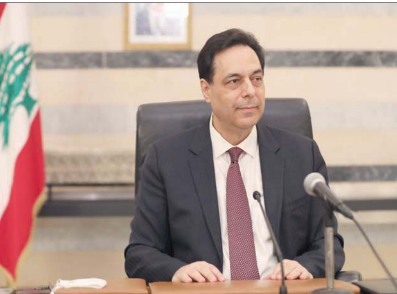
حسان دياب خلال كلمته أمس (الاتي ونهرا)

وأشار دياب إلى أنه بعد 10 أيام من نيل الحكومة الثقة «ضرب إعصار كورونا السفينة، وحاول حرف مسارها، وفرض نفسه كاولوية لكن ذلك لم يحبطنا ولم يخطئ عقولنا ولم يعطل برنامج عملنا، مشيراً إلى أن الحكومة نجحت في تأمين الحد الأقصى من الحماية للبنانيين، بمواجهة