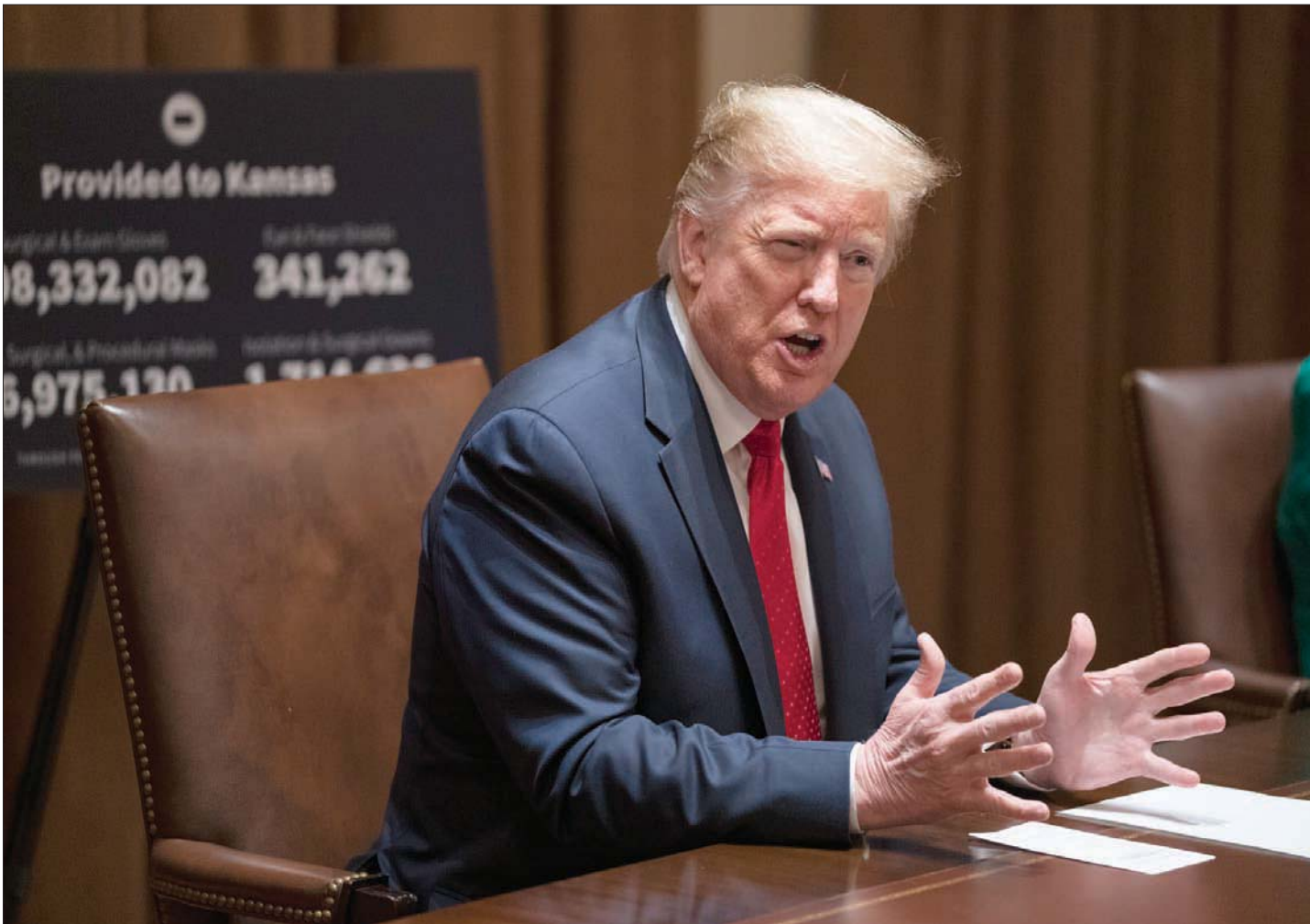
ترمب قال للجمهوريين في مجلس الشيوخ إنه متفائل بعودة الاقتصاد إلى ما كان عليه في بداية هذا العام

الولايات الجمهوريين قاموا بالإجراء نفسه، في محاولة لحماية الناخبين من العدوى. وقد بدأ ترمب الذي يصوت هو نفسه عبر البريد، بحملته ضد عملية التصويت هذه في أيريل (نيسان)، عندما قال: «على الجمهوريين مواجهة كل المحاولات الرامية للتصويت عبر البريد في الولايات. فهذا يهدد الطريق لغش كبير في الانتخابات، غالباً ما يؤدي حظوظ الجمهوريين، لسبب جهله». لكن الخبراء يقولون إن الواقع لا تدعم هذه التصريحات، فقد حقق الجمهوريون مؤخرًا نصراً كبيراً في ولاية كاليفورنيا، عندما فازوا بمقعد مخصص للديمقراطيين في مجلس النواب، وقد جرى التصويت على هذا المقعد عبر البريد بشكل أساسي.