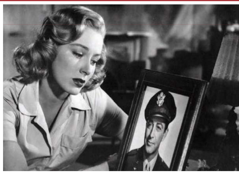
«فوق وما بعد»

في «دم ومال» هو شخص يعاني من موت بطيء زاحف، يعيش في بلدة تقع في ولاية ماين الشمالية المكسوة بالثلوج وحيداً. كان تسبب في مقتل ابنته بحادثة سير هو مرتكبها كونه كان مخوراً حين قاد السيارة. إثر ذلك انهارت حياته الأسرية ولجأ إلى