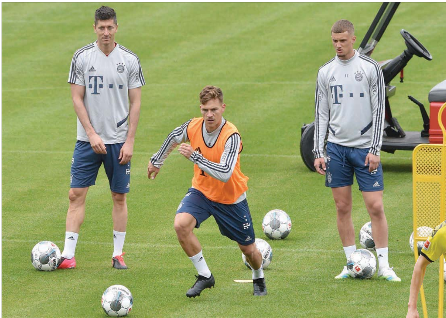
بايرن ميونخ يتطلع لمواصلة انتصاراته

ويعد أسابيع من الترقب والتكهنات، أعلن الفريق البافاري المتوج بلقب الدوري في آخر سبعة مواسم، تمديد عقد حارسه الدولي المخضرم مانويل نوير حتى 2023. وأثير جدل كبير حول مدة عقد نوير (34 عاماً) وراتبه، خصوصاً في ظل إعلان التعاقد مع حارس شالكة المميز الكسندر نوبل (24 عاماً). وقال الرئيس التنفيذي لبايرن كارل - هاينس رومينغه: «مانويل هو أفضل حارس مرمرى في العالم وقادنا». ويعدما كان متصداً لفترات طويلة قبل حقبه «كورونا»، واصل لايزنغ نزيغ النقاط بتعداد ثالث على التوالي أنزله إلى المركز الرابع. ويواجه لاعبو المدرب الشاب بوليان ناغلسمان مضيفهم ماينز الباحث عن البقاء في المركز الخامس عشر ليخطف بطاقة النجاة من الهبوط. وستجتمع أقوى مباريات المرحلة بروسييا مونشنغلادباخ الذي أصبح ثالثاً بفوزه الصريح على فرانكفورت 3 - 1. مع ضيفه ليفركوزن الفائز بنتيجة كبيرة على فيردر بريمن الجريح 4 - 1. وتتركز الأنظار على لاعب وسط وقائد ليفركوزن الدولي كاي هافترس (20 عاماً) صاحب هدفي الافتتاح في مرمرى بريمن، والذي بات مطارداً بقوة من أبرز الأندية وخصوصاً بايرن ميونخ. وساهم هافترس بسبعة أهداف (سجل أربعة وله ثلاث