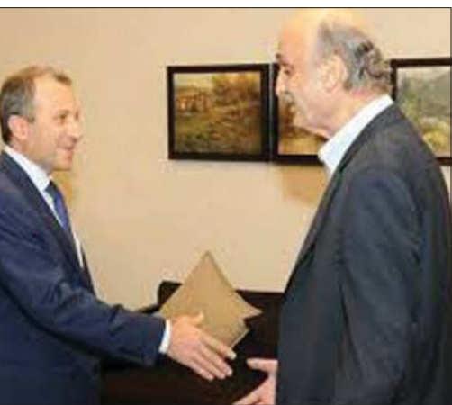
لعا سابق بين سمير ججع وجبران باسيل

وقال: «المسيحيون اليوم في حالة عادية، حتى أن التوجه في عدم ليم يصل بعد إلى مستوى التصعيد بين الراجلين بيار الجميل وريمون إدّه».