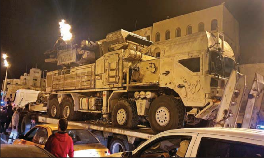
احتفال في ميدان الشهداء، بطرابلس بالاستحواذ على منظومة دفاع جوي روسية

بالمناطق الغربية، بعد سقوط مدينة غريان في يونو (حزيران) الماضي، أمس، تساقولاً حول مدى قدرتها على مواصلة هجوم «الوفاق» في تحقيق مكسب استراتيجي كبير.