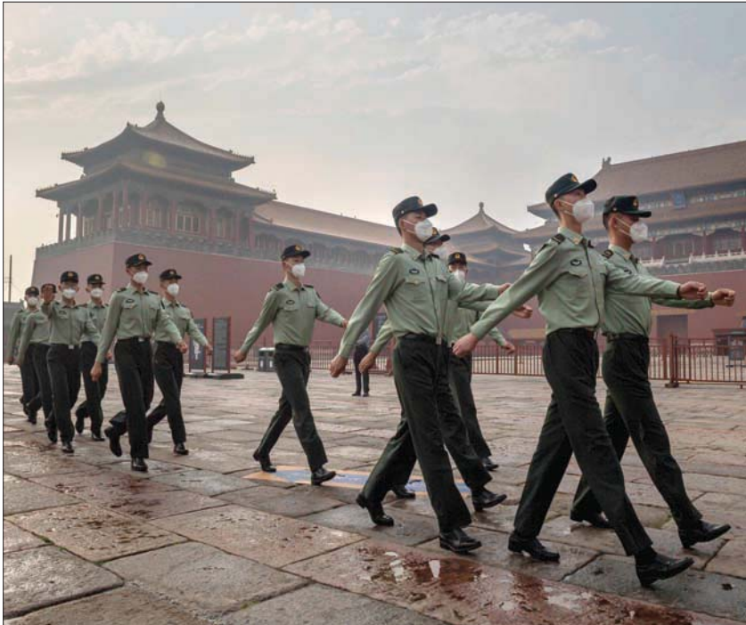
جنود صينيون عند مدخل «المدينة المحرمة» في بكين أمس

بكين - واشنطن، «الشرق الأوسط» تجاوز عدد المصابين بفيروس «كورونا» المستجد 5 ملايين في العالم، أغلبهم في أوروبا التي تواصل رفع الحجر رغم وجود خشية من حدوث طفرة وبائية، في حين تستعد الصين لإعلان «انتصارها» على الوباء، وفق وكالة الصحافة الفرنسية. وتضاعف عدد الإصابات المسجلة خلال شهر ليميل إلى 5,01 مليون على الأقل، بينها 328 ألفاً و220 وفاة. ورغم أن هذه الأرقام لا تعكس الواقع كاملاً، فإن المعطيات تظهر تسارع انتشار العدوى، خصوصاً خلال الأيام العشرة الأخيرة. وفي الصين حيث ظهر الوباء في ديسمبر (كانون الأول) الماضي في مدينة ووهان، يجتمع نواب «الجمعية الوطنية الشعبية» البالغ عددهم 3 آلاف بدءاً من اليوم الجمعة في الدورة السنوية التي دشنها الرئيس شي جينبينغ أمس. ويسبب ذلك فرصة للاحتفال بانتهاء الوباء. في هذا الصدد، قالت المحللة السياسية دايانا فو، من جامعة تورونتو، إن الدورة