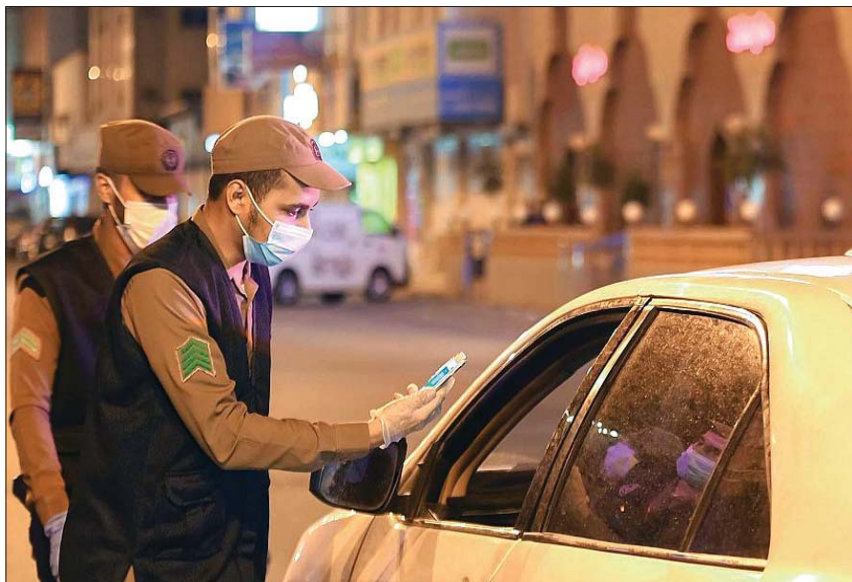
الأمن يرسد مدى الالتزام بقرار منع التجول في توك (واس)

أطلقت 28 مبادرة لتخفيف الآثار السلبية، واستدامة الإنتاج الصناعي والتعديني. ولفت إلى أن الوزارة تعمل مع شركائها في الجهات الحكومية والقطاع الخاص لتعزيز توفير الكمادات والمعقمات في السوق لسد الاحتياج الحالي والمستقبلي، مبيناً أن القطاع الصناعي ينتج 5 ملايين كمادة أسبوعياً عبر 6 مصانع، إضافة إلى 3,6 مليون لتر معقم أسبوعياً عبر 60 مصنعاً، «ولدى الوزارة خطة للتوسع ورفع الطاقة الإنتاجية استجابة للطلب المتوقع خلال الأسبوعين المقبلين بالتعاون مع وزارة الصحة». كما تطرق إلى «وجود 35 مدينة صناعية يوجد فيها 3500 مصنع و500 ألف موظف بحجم استثمارات 367 مليار ريال (98 مليار دولار)، بينما 820 مصنعاً غذائياً، و150 مصنعاً طبيياً». وذكر الجراح