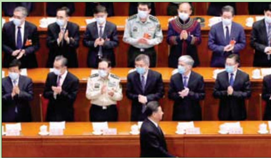
الرئيس الصيني شي جينبينغ لدى وصوله إلى افتتاح الدورة السنوية للبرلمان في بكين أمس

لندن - الرياض، «الشرق الأوسط» في هذا السياق، بدأت السعودية إتاحة أساور إلكترونية للمصابين بفيروس «كوفيد - 19». وأوضح الدكتور محمد العبد العلي، المتحدث باسم وزارة الصحة، أمس، أن الأساور الإلكترونية ليست فقط لتتبع ومعرفة مدى التزام المرضى الحجر، وإنما لتقديم خدمات نوعية تصيف مزيداً من الأطقم والرعابة للمستفيدين من هذه الخدمات كذلك. على صعيد آخر، تفاقم التوتر الأميركي - الصيني أمس، بعدما هددت بكين باتخاذ «تدابير مضادة» في حال أقر الكونغرس الأميركي عقوبات تستهدفها بسبب دورها في نشر الوباء. (تغطية شاملة في الداخل الاجتماعي)