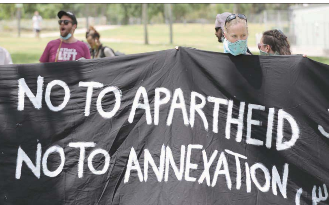
نشطاء، من اليسار أمام منزل السفير الأمريكي لدى إسرائيل رفضاً لضم أراض من الضفة

عن أن هذه المحاكمة هي إجراء سياسي تامري ضد نتنياهو. بينما يقول سياسيو المعارضة إن هذه المحاكمة هي التي تحمل رباح المؤامرة، فالشرطة التي حققت مع نتنياهو كانت بقيادة روني الشيخ الذي عينه نتنياهو في منصبه، وكان قد وعده بتعيينه رئيساً لـ«الشباباك»، والنيابة التي حسمت في تقديم لائحة اتهام كانت بقيادة شاي نتسان الذي عينه نتنياهو. والمستشار القضائي للحكومة، أيجاي مندلبليت الذي شطط ما شطب وأبقى ما أبقى من لائحة الاتهام، كان سكرتيراً لحكومة نتنياهو، ورجل أسرار، وهو الذي عينه مستشاراً قانونياً للحكومة.