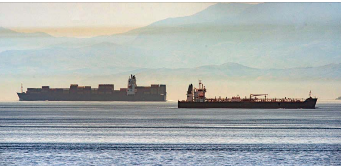
تلدن، «الشرق الأوسط»

في تحد لعقوبات الولايات المتحدة، أعلنت فرنويلا في وقت متأخر الأربعاء أنها تتجه لإجراءات عسكرية لحماية 5 ناقلات إيرانية تقترب من منطقة الكاربي، عقب تقارير عن تحرك قوة أميركية لعرقلة شحنات الوقود المبردة إلى كراكاس. وتفيد معلومات نشرتها وسائل إعلام أن 5 ناقلات نفطية غادرت إيران في الأيام الأخيرة متوجهة إلى جزر الكاربي الفنزويلية حيث أعلنت الولايات المتحدة مطلع أبريل (نيسان) عن تعزيز مراقبتها للجزيرة المنظمة في هذه المنطقة، ونشرت سفناً حربية وقطعا أخرى لتهده الغاية. وافتادت وكالة الصحافة الفرنسية، أمس، أن الرئيس الفنزويلي نيكولاس مادورو «احتفل» بالإعلان عن قرب وصول ناقلات نفط أرسلتها إيران إلى بلد.