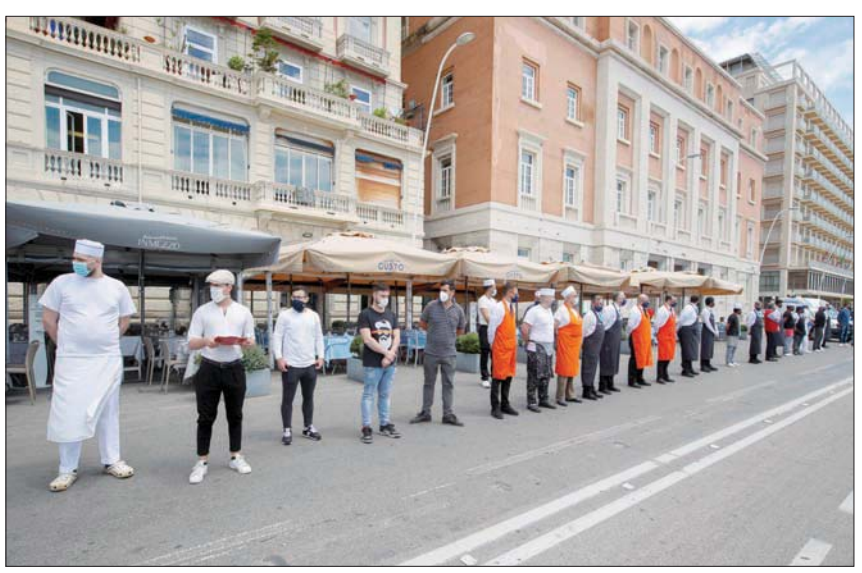
موظفو مطاعم نابولي خلال دقيقة صمت تكريماً لضحايا الوباء أمس