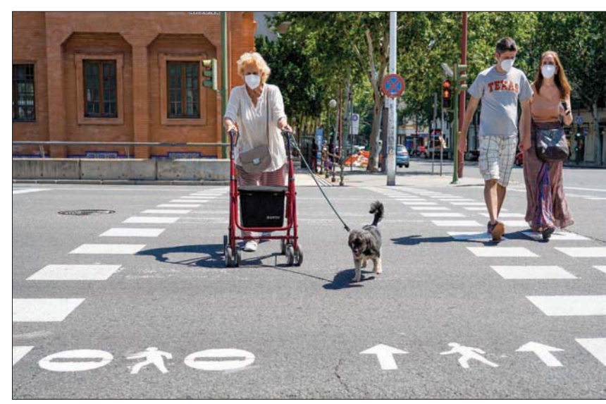
مسنة تتجول بكامتها في إشبيلية بعد تخفيف القيود أمس