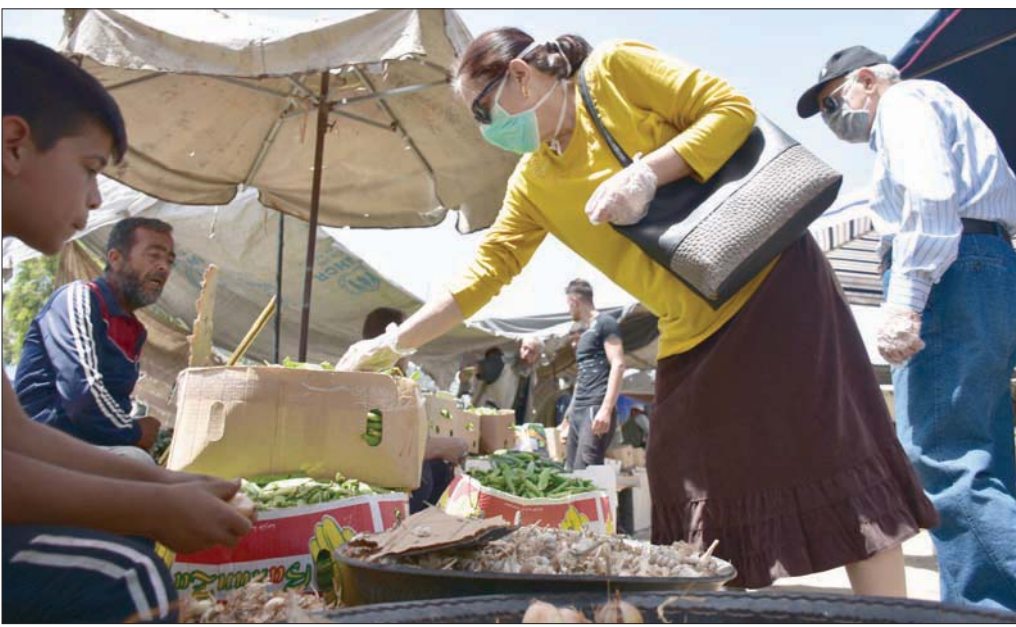
جانبا من سوق شعبية في دمشق

وحسب أرقام وزارة الصحة بدمشق فإن عدد الإصابات بفيروس كورونا المسجلة لم يتخط 581 بينها 3 حالات وفيات، و36 حالة شفاء.