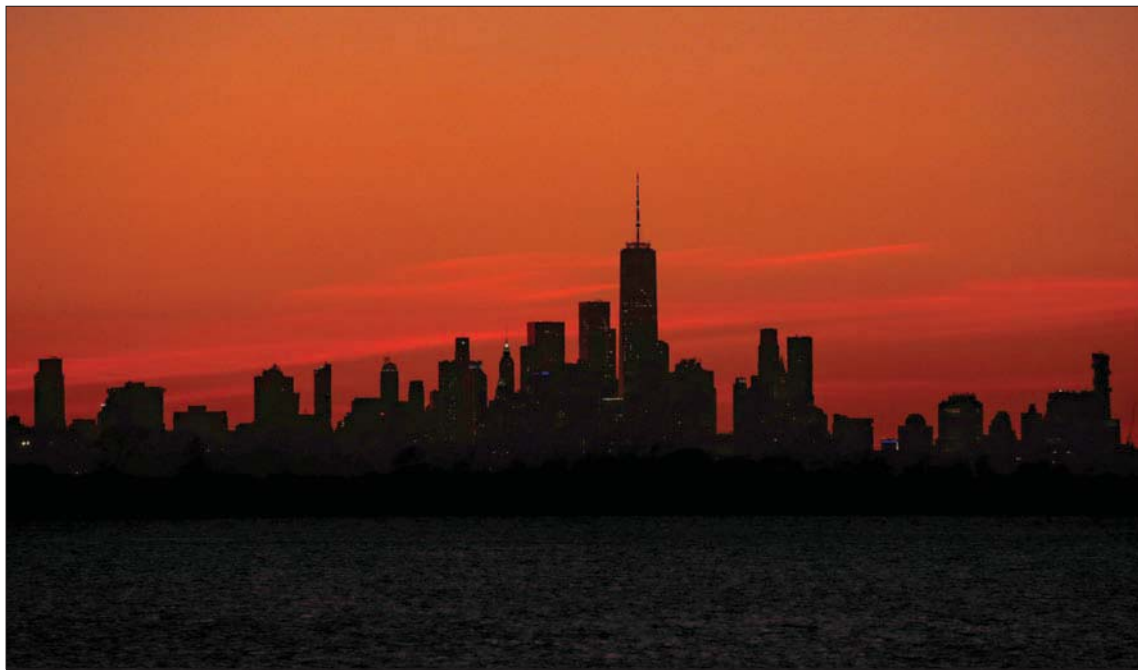
لا تتوقع منظمة التجارة العالمية أن ينتهي التراجع القياسي قريباً إذ تسبب فيروس «كوفيد - 19» في توقف الاقتصاد العالمي

الكبيرة، حسبما ذكرت وسائل الإعلام اليابانية. وبمعزل عن تأثير كورونا، وبخبر تصاعد التوتر بين الولايات المتحدة والصين مخاوف من عود الحرب التجارية بين أكبر شريكين تجاريين لليابان، قوضت العام الماضي صادرات طوكيو.