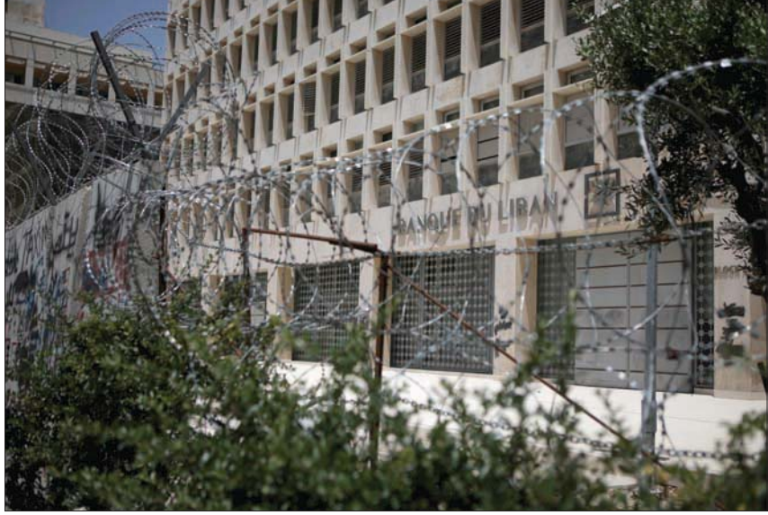
وعد حاكم مصرف لبنان بالتدخل في السوق لحماية الليرة اللبنانية