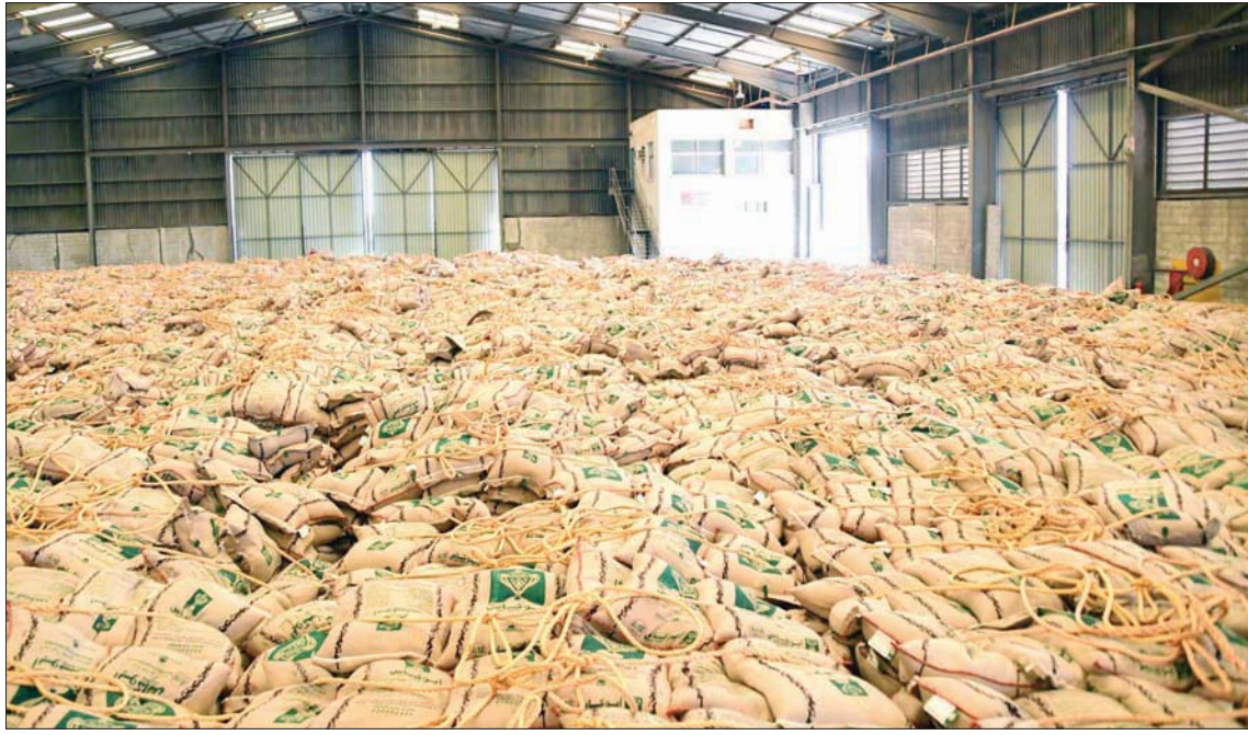
يشهد الأرز وفرة مخزون وسط نشاط الشراء في السعودية لدفعه زكاة للفطر مع نهاية رمضان المبارك (الشرق الأوسط)

الغالب تعتمد على البحث عن أجود الأصناف لما فيها من فضل يبحث عنه المستهلك المحلي من نهاية شهر الصيام الفضيل. وحول توفير الكميات لتغطية الطلب، أكد الشعلان أن الكميات متوفرة في السوق المحلية وبشكل مطمئن، وأن عمليات توفير احتياج السوق رصدت من وقت مبكر وجرى العمل على هذا النحو في تغطية حاجة المستهلك، وهو ما جعل السوق ثابتة رغم الجائحة التي عصفت بالعالم وكانت لها آثار عكسية في كثير من الدول، موضحاً أن هذا الثبات يعود لما قامت به الدولة من دعم للقطاع الخاص واستمرار تدفق السلع من بلد المصدر. وكان مجلس الغرف السعودية أكد لـ«الشرق الأوسط» في وقت سابق، أنه جرى إنشاء خلية عمل لمواجهة أي معوقات تواجه سلاسل الإمداد الغذائية والطبية من