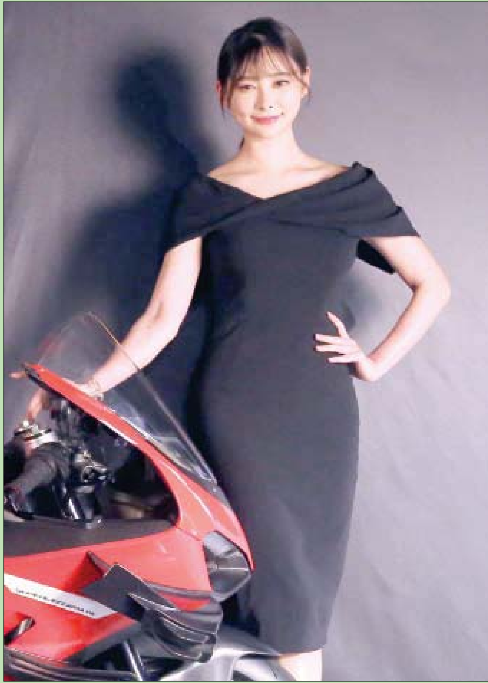
عارضة كورية جنوبية تروج لدراجة نارية أطلقتها شركة إيطالية في سيول (أ.ب.)

ثم يختم بهذه الخلاصة التي أتمنى وصولها لصناع القرار العرب المعنيين: «الأقنعة أزيحت الآن على مرأى العالم، وسنشهد 6 أشهر قادمة ملتجة، فلنستعد!»