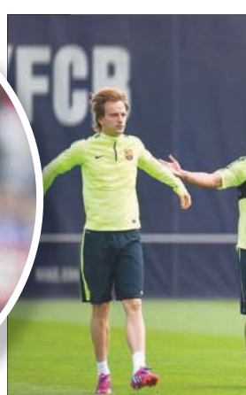
دي يونغ (يسار) أعرب عن اشتياقه لعودة المباريات

المشهد بعيداً من أعلى مستوياته مقارنة بما سيكون عليه مع وجود أشخاص (في المدرجات)، فهو قد يساعد في تجاوز تبعات فترة الحجر الصحي. مشاهدة كرة القدم وكرة السلة من جديد مثيرة للاهتمام». وقال إنريكي الذي دافع في مسيرته عن ألوان القطبين برشلونة وريال مدريد، إنه في حال كان لا يزال لاعباً «الرغبتي في العودة في أسرع وقت ممكن ليس لدي أي خوف. كنت خائفاً قليلاً على كبار السن الذين أقدرهم والذين قد يعانون من هذا المرض؛ لكن على الصعيد الشخصي، ليس لدي خوف على الإطلاق». أكد المدرب الذي قاد النادي الكاتالوني إلى الثلاثية (الدوري والكاس المحليان ودوري أبطال أوروبا) في عام 2015، أن فترة الحجر في ظل القيود التي كانت مفروضة بسبب الإقبال التام في البلاد مرت بسرعة. وتابع: «شعرت ببعض الانزعاج الجسدي بسبب الخمول، ولكن لحسن