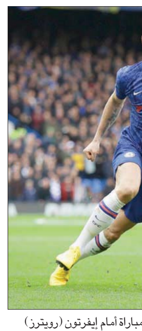
جيرو تائق وهز الشباك في آخر مباراة أمام إيفرتون

قبل أن يفعل ذلك خلال الموسم الحالي على الرغم من المنافسة القوية في خط المقدمة. ويعتبر جيرو ثالث أفضل هداف في تاريخ منتخب فرنسا بتسجيله 39 هدفاً في 97 مباراة دولية خلف ميشال بلاطيني (41 هدفاً) وتيري هنري (51). ولا يزال جيرو ضمن تشكيلة منتخب بلاده ويسعى للتواجد في صفوفه خلال كأس أوروبا التي أُرجئت إلى العام المقبل. كذلك مدد تشيلسي عقد حارسه الاحتياطي الأرجنتيني المخضرم بولي كاباييرو (38 عاماً) لمدة عام حتى نهاية موسم 2020 - 2021. وقال كاباييرو «أنا سعيد للغاية لكي أعلن ذلك (تجديد العقد). إنه امتياز بالنسبة إلى أن أكون جزءاً من فريق تشيلسي ومن عائلة تشيلسي أحد أعرق