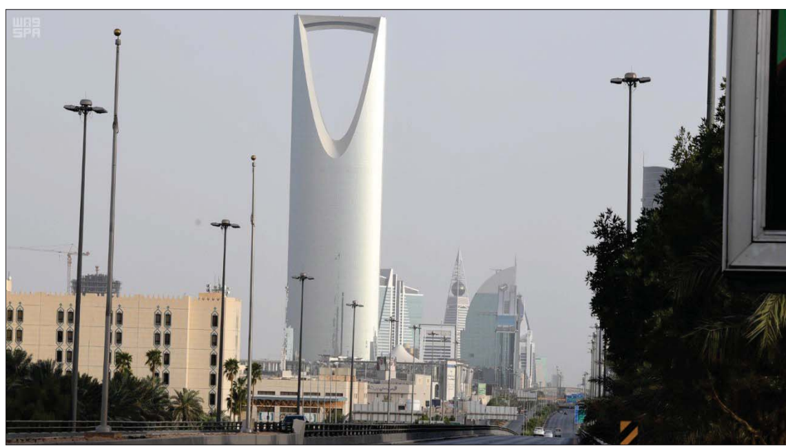
شهدت السعودية اهتماماً متزايداً من المستثمرين الأجانب رغم تداعيات «كورونا»

ويعتقد البوعيين أن جائحة كورونا ربما خلقت