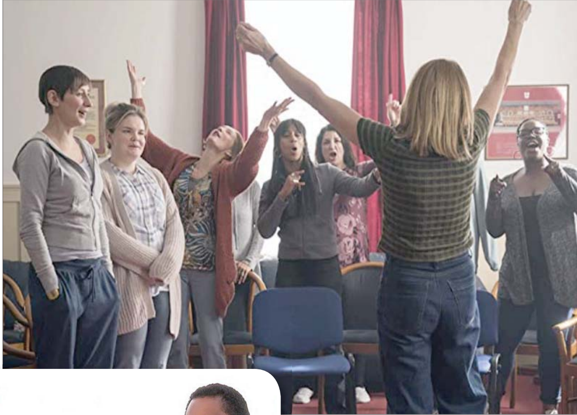
لقطة من «زوجات العسك»

يدور «الهروب العظيم» حول أسرى حرب أميركيين وبريطانيين يفلتون الهرب من السجن الألماني. سمعة الفيلم تتجاوز قيمته الحقيقية. على تعدد مثليه ينتمي الفيلم إلى ستيف ماكوين وجاذبيته (DVD فقط).