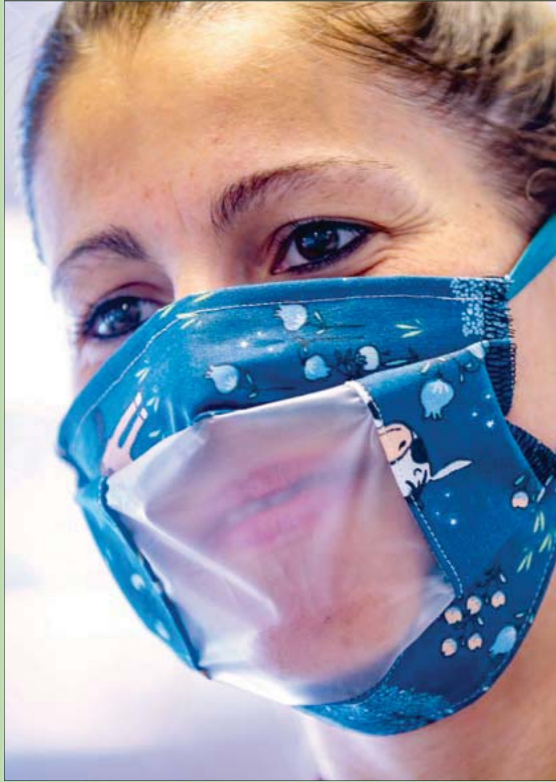
بلجيكية ترتدي قناعاً شفافاً لمساعدة الصم على قراءة الشفاه

خليك ربي (سكتم بكتم)، لهذا أنا محبوب ومحترم (وجاب العبد)!