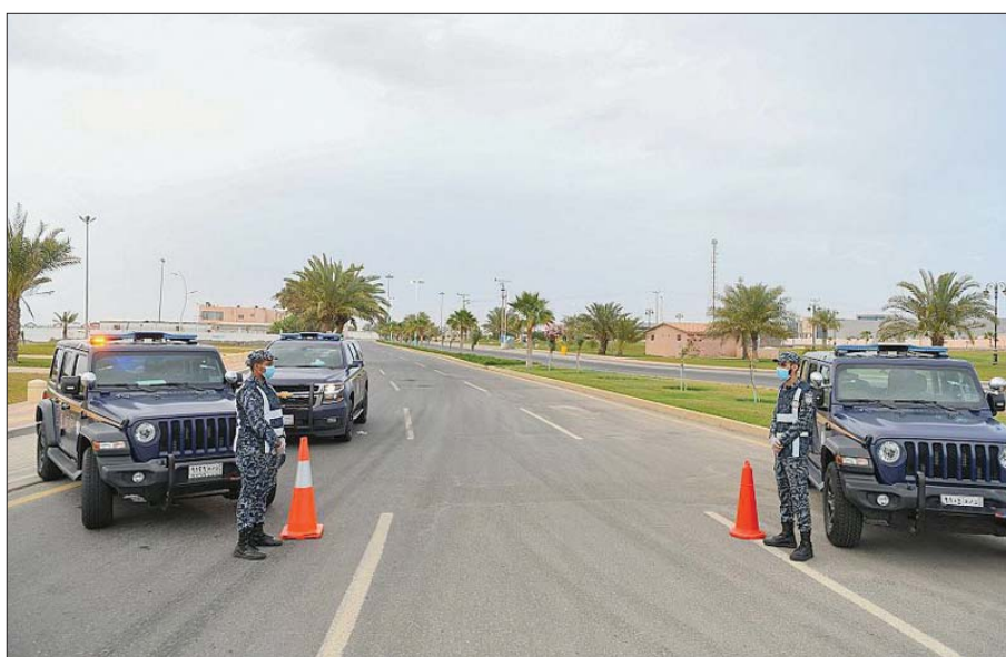
رجال الأمن يطبقون أمر منع التجول في محافظة أمّالج (واس)

من جهتها، كشفت وزارة الصحة القطرية أمس عن رصد 1153 إصابة جديدة مؤكدة بفيروس كورونا (كوفيد -19)، ليصل عدد الحالات المسجلة في قطر إلى 29425 حالة. كما سجلت خلال 24 ساعة الأخيرة ليرتفع بذلك إجمالي عدد الحالات المسجلة في البلاد إلى 12860 حالة، ويخضع 9124 مصاباً