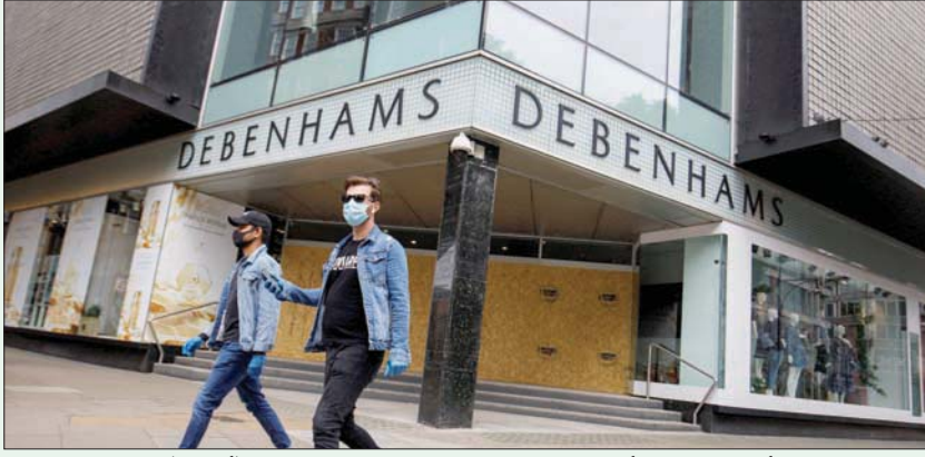
أزمة «كورونا» أضرت بكثير من المتاجر الكبرى في لندن