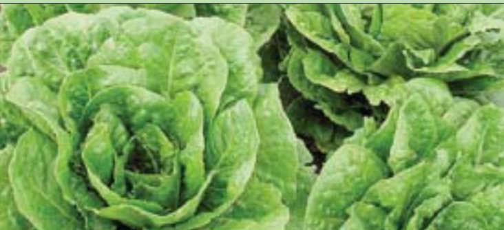
قابلية أوراق الخس للتلطف السريع تضر قيمته

تتقترن بدرجات حرارة تخزين عالية تعزز نمو البكتيريا اللاهوائية على الخس المعبأ. ويقول الدكتور إيفان سيمكو، الباحث بوحدة تحسين وحماية المحاصيل بدائرة البحوث الزراعية في ساليانس بكاليفورنيا، «بدلاً من هذه الحلول المكلفة، والتي قد تكون لها آثار سلبية، لجأنا إلى الحلول على الحمض النووي لتطوير خطوط تكاثر جديدة تكون معدلات التدهور فيها بطيئة».