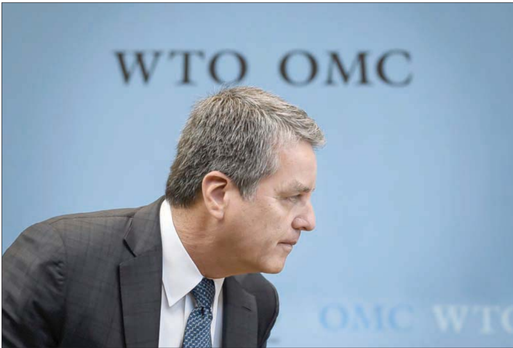
رئيس منظمة التجارة روبرتو أزيديو قرر الاستقالة قبل عام من اكتمال ولايته الثانية (أ.ب)

قضاة جدد فيها يحلون محل القضاة الذين انتهت ولايتهم. والآن تواجه التجارة العالمية مخاطر لم تواجهها منذ سنوات الحرب الباردة في القرن العشرين. على المدى القصير، أصابت جائحة فيروس «كورونا» حركة التجارة العالمية بالشلل تقريباً. وتوقع منظمة التجارة العالمية بالشلل تقريباً. تراجع حركة التجارة خلال العام الحالي بما يصل إلى 32%. وفي حين كان حجم تجارة السلع بين دول العالم تزداد بشكل مطرد عند التفاوض عن التقلبات من شهر إلى آخر، فإنه شهد تراجعاً على مدى نحو عام متصل حتى قبل تفشي الجائحة. والاتفاق التجاري بين الولايات المتحدة والصين والذي تم الإعلان عنه بكثير من الضجيج في يناير (كانون الثاني) الماضي لا يساوي الحبر الذي كتب به، حسب فيكلنغ. ومؤخراً هدد الرئيس الأميركي دونالد ترمب، بالتراجع عن هذا الاتفاق، في الوقت الذي يتهم فيه الصين بالمسؤولية عن تفشي فيروس «كورونا» في العالم. ورغم أن المشهد الراهن يبدو قاتماً للغاية، فإن مسار تحرير التجارة لم يكن سهلاً أبداً. فقد ولدت منظمة «جات» على أطلال منظمة التجارة الدولية والتي بلورها جون مينارد كينز، كمنظمة عالمية