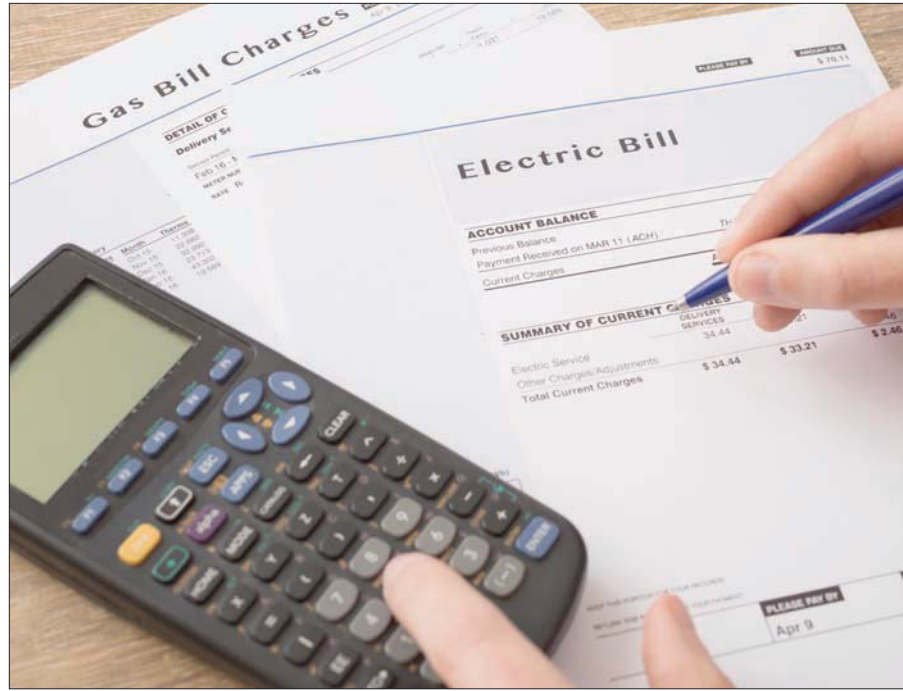
العمل من المنازل زاد نفقات الكهرباء، والانتزرت