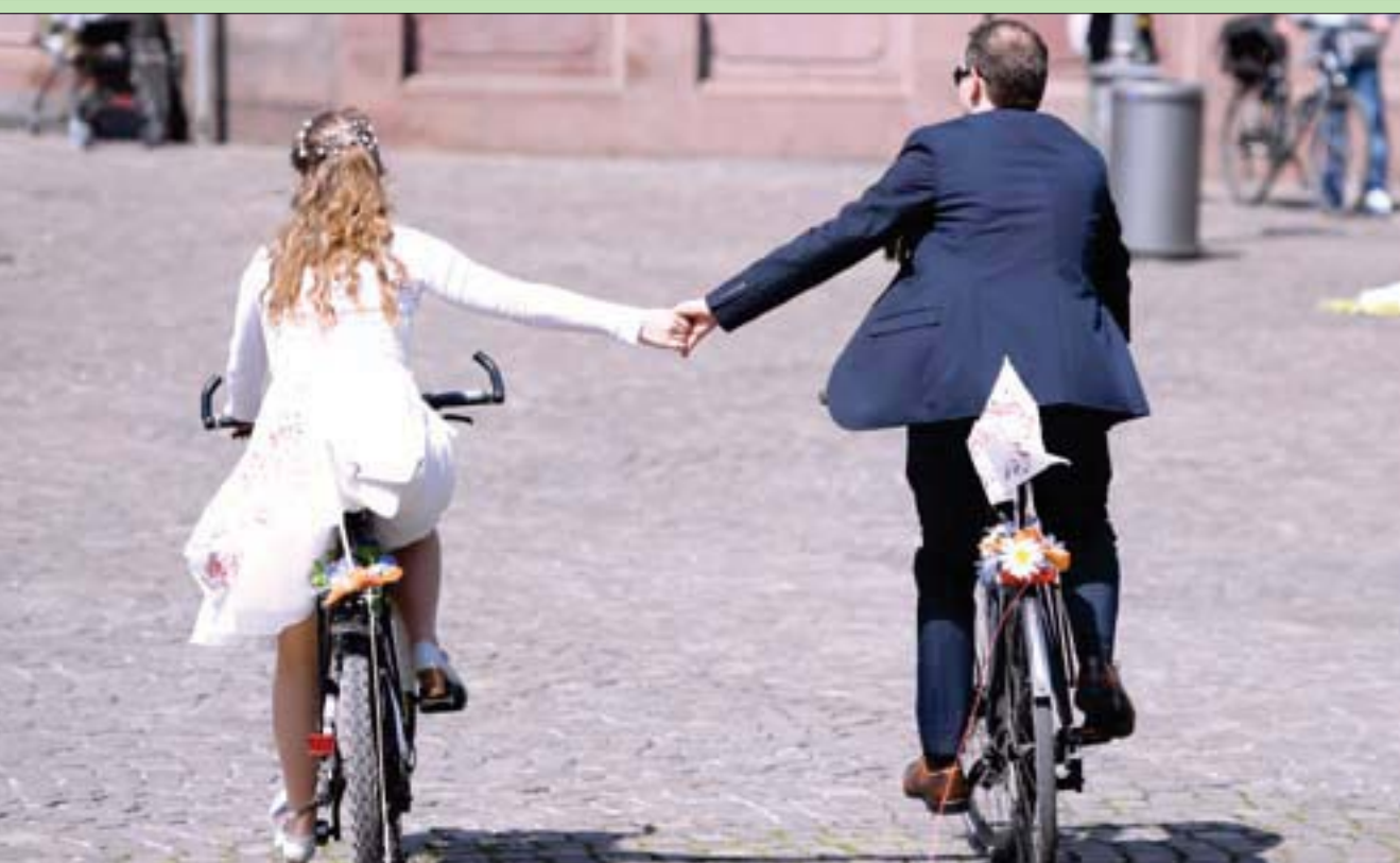
عروسان يحتفلان بعد عقد قرانهما في فرانكفورت أمس بالتجول على الدراجة

يحفل الخس مكانة مهمة في المائدة الرمضانية، فهو المكون الأساسي لطبق السلطة، ومع ذلك فإننا كثيراً ما نفاجأ عند الشراء بنحول بعض أوراقه إلى اللون البني، وهي المشكلة التي قطع فريق بحثي أميركي شوطاً كبيراً نحو حلها، وتم الإعلان أول من أمس عن هذا الحل في الموقع الإلكتروني لدائرة البحوث الزراعية