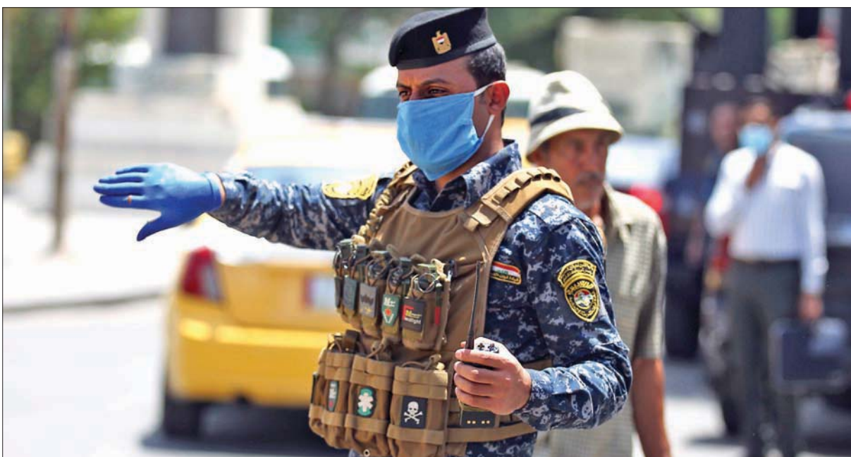
جندي عراقي يوجه السير في ساحة التحرير في بغداد

بغداد، «الشرق الأوسط» في وقت شيع أهالي سامراء شمال عراقي بغداد أمس قتلى الهجوم الذي شنه تنظيم داعش على إحدى القرى مما أدى إلى مقتل مختار القرية وولديه، قتل طيران التحالف الدولي 7 من عناصر هذا التنظيم في محافظة نينوى.