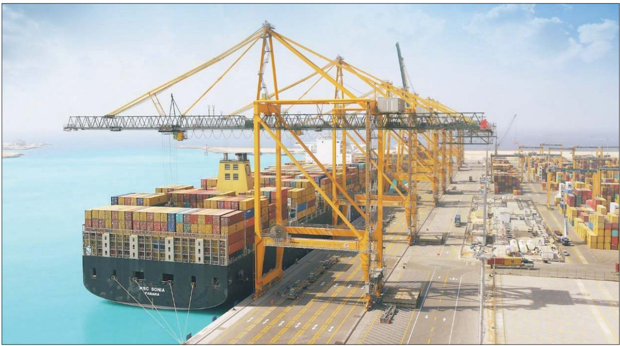
السعودية تفتح خطاً ملاحياً جديداً على الخليج العربي توسيعاً لحركة الحاويات مع الشرق الآسيوي (الشرق الأوسط)

وموانئ دول شرق آسيا خلال هذا الوقت الحرج للاقتصاد العالمي؛ تعزيراً على صلابة الاقتصاد السعودي ومئات سلاسل الإمداد في المملكة». ومعلون أن الهيئة العامة للموانئ أعلنت مؤخراً عن بدء تشغيل خط ملاحى آخر يربط المملكة مع دول شرق أفريقيا وذلك عن طريق الخط الملاحى الذي يعد أول خط شحن للحاويات يصل إلى ميناء الملك فهد الصناعي ينبع، بما يسهم في تعزيز حركة الصادرات والسوارات من وإلى ميناء ينبع الصناعي وميناء جدة الإسلامي.