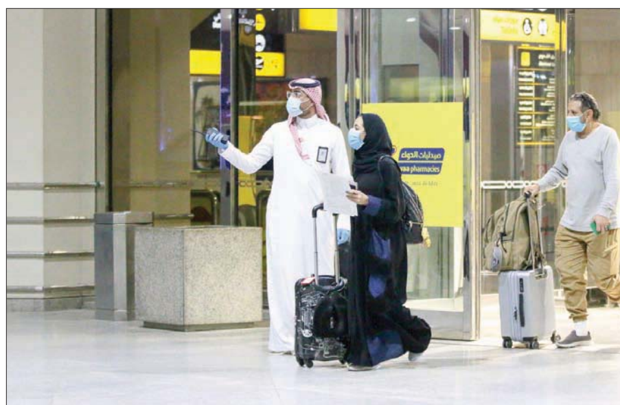
وصول رحلة سيدني إلى مطار الملك فهد بالدمام ضمن الرحلات المخصصة لعودة المواطنين

السعودية، طُفّت جميع التدابير الصحية والوقائية من فيروس كورونا المستجد (كوفيد -19). إلى ذلك، أكدت الهيئة العامة للطيران المدني تطبيق أعلى معايير السلامة التشغيلية والإجراءات الوقائية والتدابير للوقاية من جائحة فيروس كورونا المستجد والحد من تأثيرها على سلامة الطيران، مشيرة إلى أنها تتأكد من سلامة