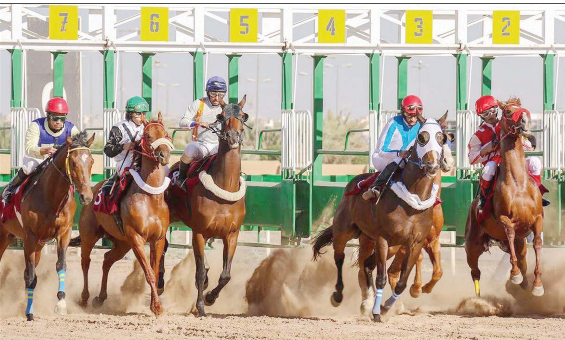
من أحد سباقات الفروسية في السعودية (الشرق الأوسط)

وقال إن البطولة التاريخية في سباقات الفروسية السعودية حظيت برعاية كريمة من خادم الحرمين الشريفين الملك سلمان بن عبد العزيز، ودعم مباشر من ولي العهد الأمير محمد بن سلمان، وضعت أنها أغنى البطولات عالمياً، بجوائز مالية تتجاوز 29 مليون دولار، وبمشاركات عالمية ومحلية لأشهر النجوم العالميين وأشهر الهجان، التي تحضر لأول مرة إلى المملكة.