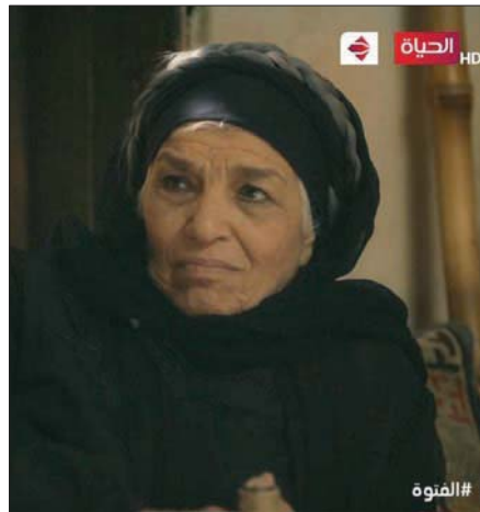
الفنانة إنعام سالوسة

مع أرملة نجله «رقية»، وتجسدها دينا الشربيني، لقناعته بأنها من تسببت في مقتلها. كما تالقت الفنانة سميرة عبد العزيز (85 سنة) بمشهد عتاب شقيقها «سليم منصور» الذي يجسده محمود حميدة في مسلسل «ما كنا صغيرين»، والفنانة دلال عبد العزيز (60 سنة) بشخصية «ميس عفاف عصمت» في مسلسل «فلانتينو»، والفنان أحمد فؤاد سليم (62 سنة) بدور والد «الشهيد» أحمد صابر المنسي» في مسلسل «الاختيار»، بجانب الفنانة ماجدة منير التي أبهرت الجمهور بأدائها في المسلسل نفسه، فضلاً عن دورها في «ما كنا صغيرين».