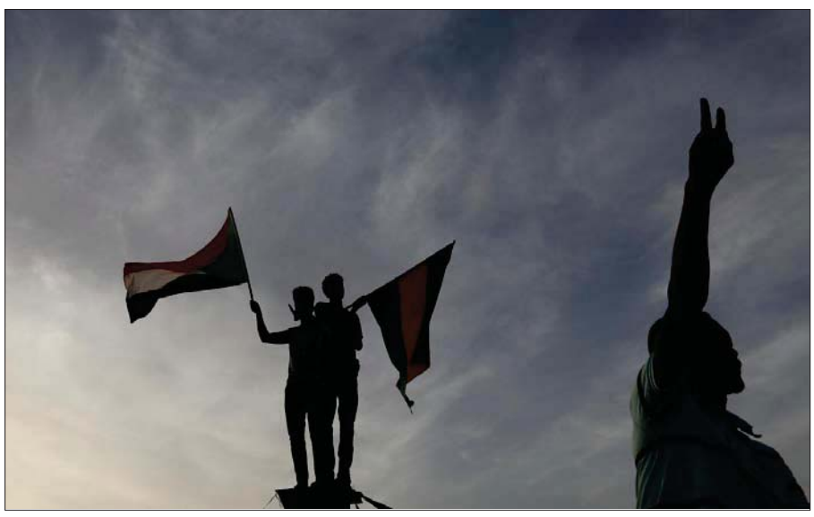
شُرعت الحكومة السودانية في تنفيذ زيادة كبيرة لأجور العاملين بالدولة

تدرس كل جوانبها الاقتصادية بشكل متكامل لأنها تحتاج إلى توحيد الهيكل الرأبتي، ومعالجة التشوهات والفرهال الكبير في الوظائف الحكومية، كما تحتاج إلى موارد حقيقية.