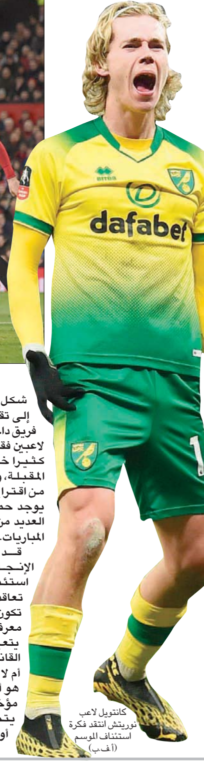
كانتويل لاعب نورويتش انتقد فكرة استئناف الموسم

وعلاوة على ذلك، تم مناقشة فكرة إلغاء الهبوط من الدوري الإنجليزي الممتاز هذا الموسم عندما عقدت الأندية العشرين التي تلعب في الدوري الإنجليزي الممتاز اجتماعاً، وعارض رؤساء أندية برايتون وستهام وأستون فيلدا علناً خطة الملاعب المغلقة ويبدو أنهم لن يتراجعوا عن موقفهم إلا إذا كان هناك اتفاق على إلغاء الهبوط هذا الموسم. وتعود الفرق المهدهة بالهبوط إلى الدرجة الأولى «تشمابيونثيب» حملة