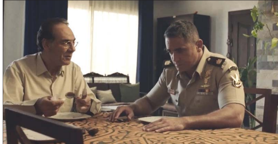
الفنان أحمد فؤاد سليم في لقطة من «الاختيار»

وعبر ظهوره بحلقتين فقط بمسلسل «البرنس»، استطاع الفنان الكبير عبد العزيز مخيون