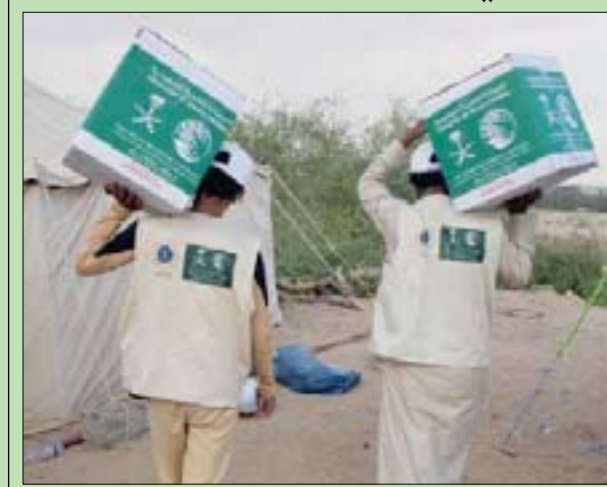
جانب من أعمال توزيع التمور السعودية في اليمن

مواجهة الجائحة، وأولوية عمل المنظمات الدولية من خلال الوقوف مع اليمن لمواجهة جائحة كورونا. وفي نهاية الاجتماع استعرض أول لوتسما الممثل المقيم لبرنامج الأمم المتحدة الإنمائي في اليمن إطار أعمال الأمم المتحدة وطرق استجابتها الاجتماعية والاقتصادية لجائحة كورونا. كذلك أشاد المشاركون في الاجتماع بتنظيم المملكة العربية السعودية مؤتمر المانحين لليمن، والذي سيعقد في 2 يونيو (حزيران) المقبل بمشاركة الأمم المتحدة، حيث تُنن مخصصو التنمية هذه الخطوة لكونها أحد أهم الإجراءات لتذليل