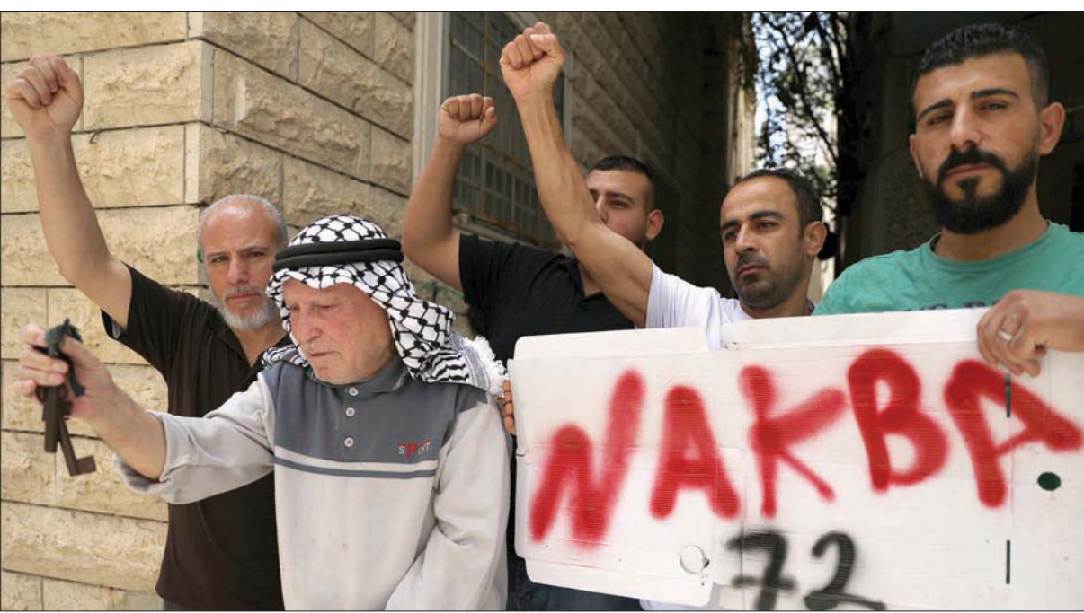
فلسطينيون يحيون الذكرى الـ 72 للنكبة جنوب مدينة الخليل في الضفة الغربية أمس

تنظيمياً وعسكرياً واقتصادياً، باحتلال حصنها ونصف حصة الدولة الفلسطينية. وقد فعلت ذلك من خلال عملية تهجير لنحو 800 ألف فلسطيني من مدنهم وبلداتهم الأصلية، من أصل مليون و400 ألف فلسطيني كانوا يعيشون في 1300 قرية ومدينة.