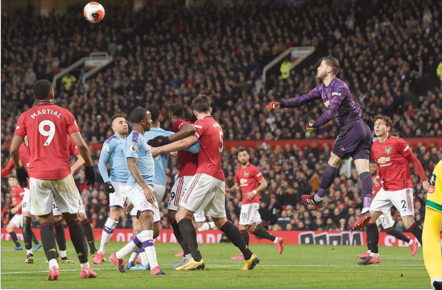
هل سيكون اللاعبون سعداء باللعب في منافسات تتطلب التحامات بينما يُطلب من المواطنين التزام إرشادات التباعد الاجتماعي؟ (أ.ب.)

وسيكون من المفاجئ والغريب إذا لم يقم كل مدير فني بإجراء حوار مماثل مع لاعبيه في كل ناد من الأندية الإنجليزية. ومهما كان الهدف من استئناف الموسم في بيئة معقمة ومن دون جمهور، فإن الشيء المؤكد هو أن الظروف الحالية لا تضمن الحفاظ على النزاهة الرياضية. ومن دون الخوض في إمكانية قيام بعض الأندية باللعب من دون أي اهتمام خلال ما تبقى من الموسم، أو في ظل رغبة بعض الأندية في إنهاء الموسم الحالي من دون لعب المزيد من المباريات، فإن الجدول النهائي للدوري الإنجليزي الممتاز خلال الموسم الحالي سيكون هو