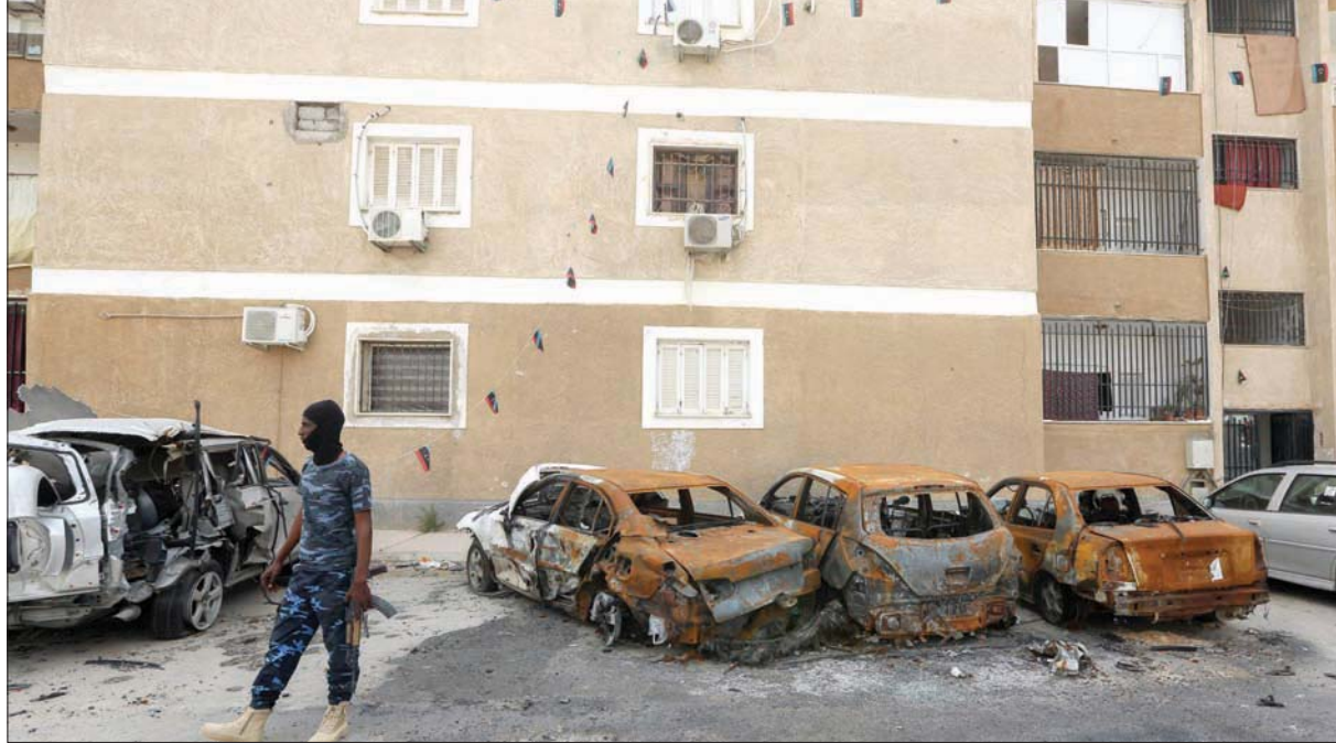
سيارات تعرضت للتدمير جراء معارك طرابلس

حلف «الناثو» يعرض مساعدة «مشروطة» لحكومة السراج