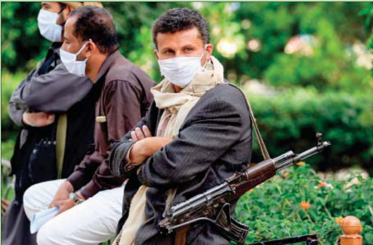
مسلحون تابعون للحوثيين في أحد شوارع صنعاء

وانتهت الحاجة لها مع قتل الرئيس السابق، فاصدر قرارا بتعيين عمه عضوا في مجلس الشورى لكنه رفض ذلك علانية، فعاد وعينه وزيرا للدخلية، وبالمثل فعل مع ابن عمه ولكنه رفض عضوية مجلس الشورى ولهذا تم تعيينه عضوا في المجلس السياسي الأعلى.