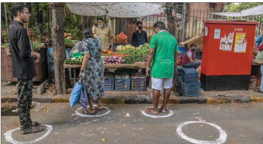
الأسواق تحاول الالتزام بتدابير الوقاية

الفقيرة من حيث المساحة في مومباي. وفي محاولة لتتبع الحالات، ينتشر العاملون الصحيون بين مختلف الحارات الصغيرة والأزقة الضيقة؛ بعضها لا يسمح بمرور شخصين متجاورين، إذ يتعين عليك الانحراف جانباً حتى تتمكن من المرور. ويضع العاملون الصحيون حجراً قليلاً لا تسهل إزالته على أيدي الأشخاص الذين تعرضوا للعدوى بالفيروس، مع التشديد على بقائهم داخل منازلهم لا يخادونها لمدة أسبوعين كاملين. وفي الأثناء ذاتها، يواصل