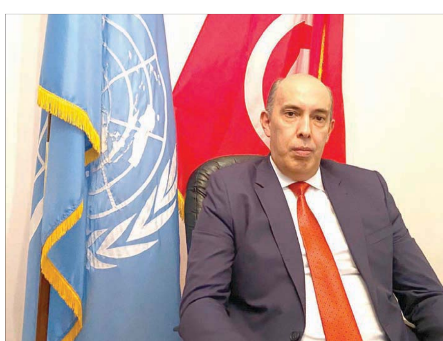
المنندوب التونسي الدائم لدى الأمم المتحدة قيس قبطني

ولا ببلد معين». وشدد على أن «إنهاء العمل بالمساعدات عبر الحدود يستدعي مقاربة جديدة، وفي ملف إيران وجهود الولايات المتحدة لتمديد حظر الأسلحة عليها، قال قبطني إن «موقفنا من مسألة انتشار الأسلحة معروف للجميع»، موضحاً: «إننا نرفض كل ما يؤدي إلى انتشار الأسلحة، سواء الباليستية أو الأسلحة غير التقليدية. هذا موقف مبدئي. وتونس من منطلق سياستها الخارجية لها علاقة بإيران»، وشدد على أن «تونس ترفض كل أشكال التدخل في الشؤون الداخلية للدول العربية»، وشدد على «أمن حول الملف اليمني. وموقفنا المنطوق. ولكن مع ذلك، نحن ندعو طبعاً إلى تغليب مبادئ الجوار والتعايش السلمي بين الدول، واعتماد الحوار والتفاهم لتسوية الخلافات العالقة».