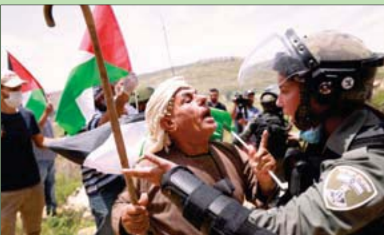
فلسطيني يجادل جندياً إسرائيلياً خلال مظاهرة احتجاجية في الذكرى 72 للكتبة بقرية قرب نابلس أمس