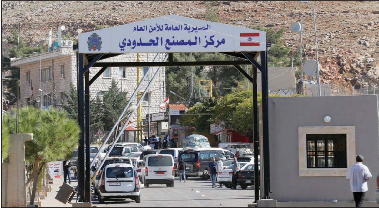
صورة من الأرشيف لمعبر المصنع عند الحدود اللبنانية - السورية

ضُبطت خلال الساعات الماضية. وشدد على أهمية التنسيق بين مختلف الأجهزة الأمنية والعسكرية لتأمين نجاح الإجراءات المتخذة التي أقرت في مجلس الوزراء والمجلس الأعلى للدفاع. وعزز الجيش اللبناني إجراءاته لضبط الحدود ومنع عمليات التهريب إلى سوريا، وهو ما تقوم به «القوات اللبنانية» التي دعا نائب عنها «حزب الله» ليكون شريكاً في وقف التهريب. وتابع الرئيس اللبناني ميشال عون، أمس، مسار الإجراءات التي تقرر اتخاذها لضبط عمليات التهريب عبر الحدود البرية ولا سيما تهريب المواد المدعومة مثل المحروقات على أنواعها والطحين وغيرها. وتلقى عون سلسلة تقارير حول التدابير التي نُفذت لوضع حد للتهريب عبر المعابر البرية غير الشرعية والعمليات التي