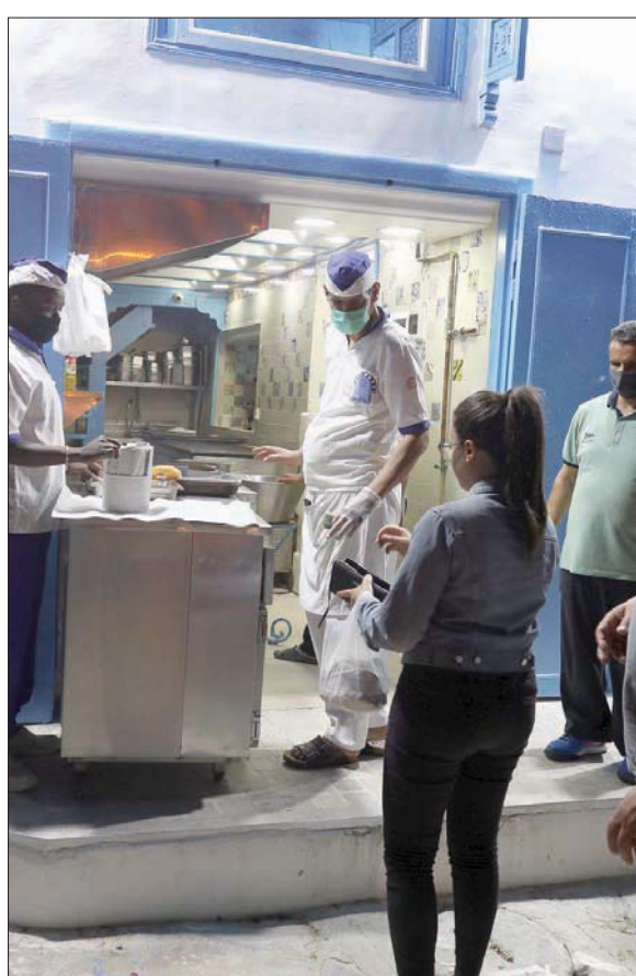
مواطنون يشترون حلويات محلية في قرية سيدي بوسعيد قرب العاصمة التونسية مساء الخميس

وبدأت تونس منذ الرابع من مايو (أيار) بالرفع التدريجي لقيود الإغلاق التام.