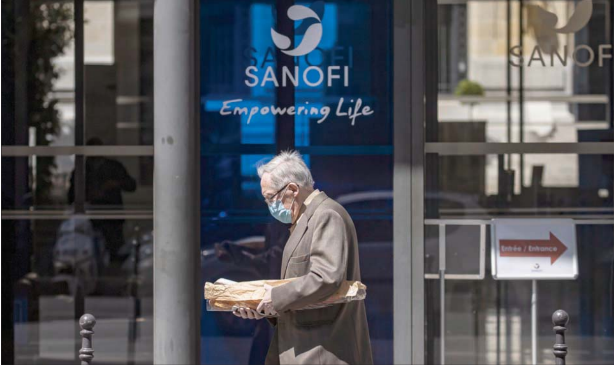
مقر شركة «سانوفي» في باريس (إ.ب.أ)

عندما أعلن البريطاني بول هودسون، مدير عام شركة سانوفي الفرنسية العاملة للأدوية، يوم الأربعاء الماضي في حديث لوكالة بلومبيرغ أنه ستكون للولايات المتحدة الأميركية الأولوية في الحصول على اللقاح المضاد لفيروس «كورونا»، والذي تعمل الشركة المذكورة على تطويره وإنتاجه بحجة أن الجانب الأميركي قدم كثيراً من المال من أجل الأبحاث، شاركت ثائرة المسؤولين الفرنسيين على أعلى المستويات. الرئيس إيمانويل ماكرون سارع إلى الاتصال برئيس الشركة سيرج واينبرغ ليوخه، فيما غُذِر رئيس الحكومة مهذداً وكذلك فعل وزير الاقتصاد وغيرهم من المسؤولين، إضافة إلى سياسيين من الأثرية والمعارضة.