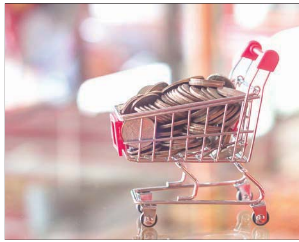
اعتقد بعضهم أن فترة الحجر المنزلي ستسمح بالادخار

المائة، واللافت في الموضوع أن زيارة المستهلكين إلى «السوبر ماركت» انخفضت، ولكن نسبة الإنفاق زادت، لتصل إلى 524 مليون جنيه إسترليني في شهر واحد. وزاد الإنفاق أيضاً على شراء معدات الرياضة بعدما أقيمت النوادي أبوابها، فتهافت الناس، في بريطانيا على سبيل المثال، على شراء الألبسة الرياضية والدرجات الهوائية وغيرها من لوازم الرياضة، وزادت نسبة الإنفاق بشكل لافت على التسجيل على المواقع الإلكترونية للالتحاق بدورات تدريبية تدرس عن بعد للحصول على شهادات في مجالات متعددة.