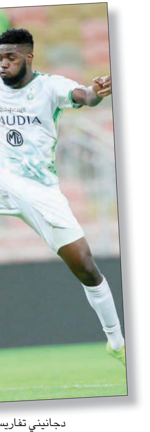
دجانيني تفاريس (الشرق الأوسط)

العرض على أن يكون قرار العودة للدوري البرازيلي هو المفضل بالنسبة له في حال لم يتفق مع الهلال على تجديد عقده الذي ينتهي في يوليو (تموز) المقبل. ويعد كارلوس إدواردو واحداً من أبرز اللاعبين المحترفين في تاريخ نادي الهلال، حيث ساهم خلال السنوات الخمس الماضية في تحقيق العديد من البطولات في خزينة النادي وقد انضم للهلال،