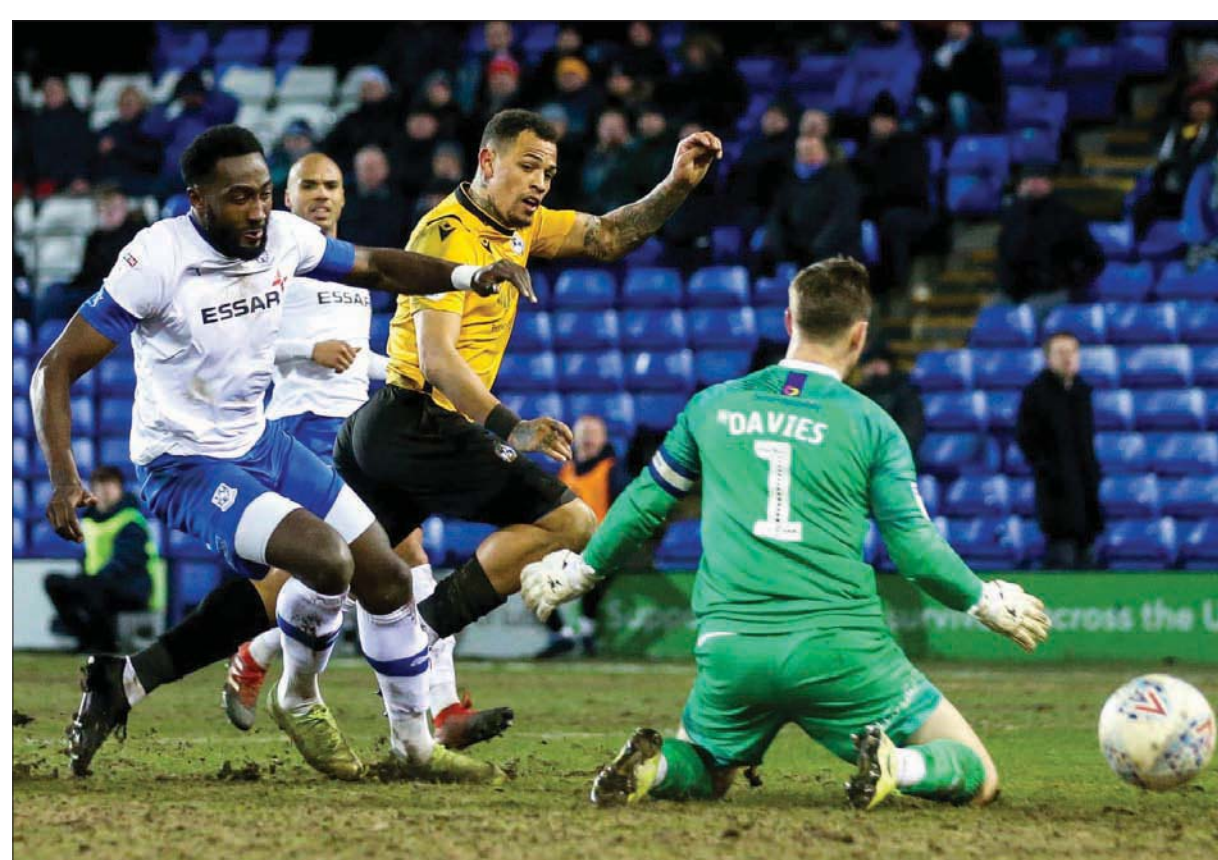
فريق ترانمير استضاف بريستول في فبراير الماضي قبل تفشي الوباء

من بيع تذاكر المباريات. وقد يتطلب الأمر استخدام رابطة اللاعبين المحترفين لبعض احتياطاتها التقديرية الكبيرة لدعم الأندية في دفع أجور اللاعبين، حتى تتمكن الأندية من الحصول على مواردها المالية المعتادة مرة أخرى. وما فائدة هذه الاحتياطات إذا لم تستخدم في مساعدة اللاعبين في وقت عصيب مثل الوقت الحالي؟ وهناك المزيد من المخاطر التي تنتظرنا، حيث اعتقد أن تمويل ملاك الأندية سينخفض كثيراً بسبب التأثير الكبير لأزمة كورونا على شركاتهم ومؤسساتهم التجارية. ولعل الأمر الأكثر خطورة هو أن الملاك قد يفكرون في بيع الأندية بمقابل مادي قليل، وبالتالي قد نرى هذه الأندية في نهاية المطاف تحت ملكية جهات أو أشخاص لا يرتقون مستوى كرة القدم الإنجليزية. وإذا كنت تريد استمرار كرة القدم، فیتعين علينا أن ن فكر في جميع التفاصيل المتعلقة بهيكل هذه اللعبة. وقبل كل شيء، هناك حاجة لإعادة التفاوض بشأن عقود اللاعبين في الأندية