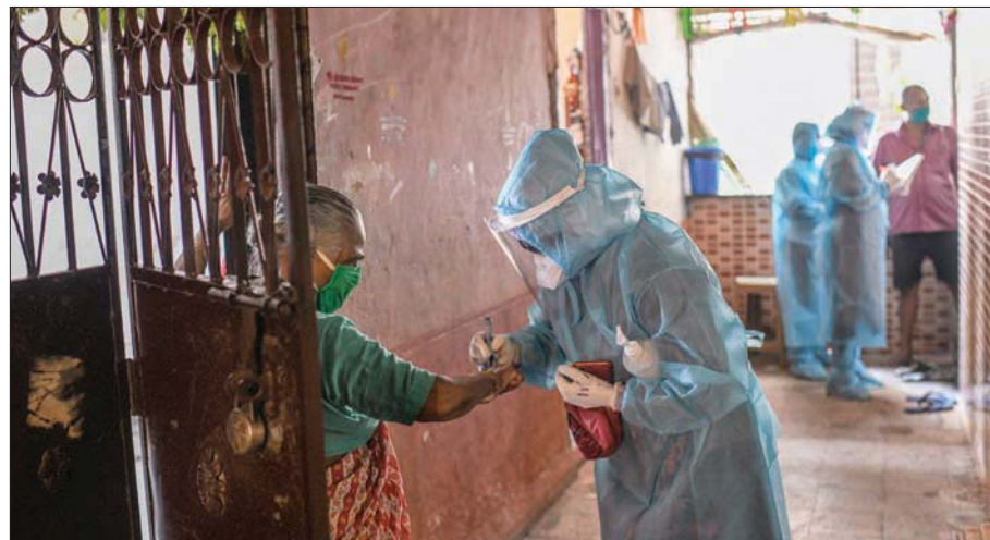
عاملة صحة تضع علامة على يد مصابة محتملة

ومع مواصلة فيروس كورونا الانتشار عبر مختلف أرجاء الهند، انفردت مومباي وحدها بأسوأ جولات الفيروس الجديد، إذ تعد المدينة التي يبلغ تعداد سكانها قرابة 20 مليون نسمة مسؤولة على الأونة الراهنة عن عدم التمسك بإطلاق توقعات متفائلة، فيما انطلقت حملات واسعة في العاصمة الروسية لإجراء فحوص مجانية للمواطنين على نطاق واسع، ما دفع إلى توقع