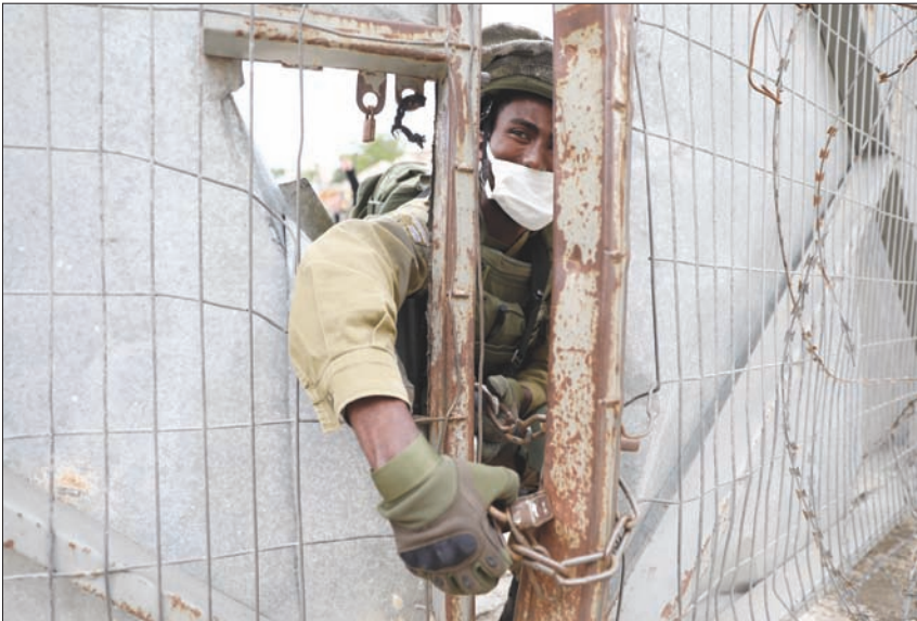
جنود إسرائيليون يفتحون قفل بوابة في الخليل بالضفة للسماح بمرور مستوطنين

الماضين، منها نقل السفارة الأميركية إلى القدس، وإغلاق مكتب منظمة التحرير، ووقف الالتزامات المالية الأميركية لـ«الأونروا»، وشطب ملف اللاجئين. واجتماع الخميس يأتي بعد تشكيل عباس لجنة مشتركة من أعضاء من اللجنتين التنفيذية والمركزية لوضع البات الرد على القرار الإسرائيلي المحتمل لضم أجزاء من الضفة الغربية، وطلب عباس من اللجنة وضع ردود وسبل مواجهة التذاعبات المحتملة سياسياً واقتصادياً وأمنياً بعد قرارات السلطة المرتقبة.