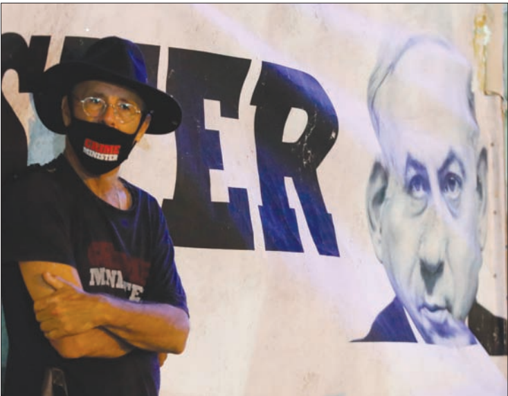
إسرائيلي في مظاهرة رفعت شعارات ضد ننتياهو والائتلاف الحكومي

كتلة (يمينيا)، فضل الصراع على الحقائق الوزارية، ونحن نقيم حكومة ستكون الأولى في تاريخ إسرائيل التي ستعلن السيادة الإسرائيلية على مناطق (يمينيا) ملتزم فعلاً بتطوير وتنظيم الاستيطان، (يمينيا) لا يبيع اليهودية لنشطاء حزبيين، والاقتصاد الإسرائيلي لعمر بيرتس والهستروت (العقابات)، (يمينيا) لا يرفع يده عن النضال من أجل إخراج المتسللين وترميم الأحياء»، وأنهم سارع حزب الليكود إلى رد هذه التهمة، قائلًا، إن «يمينيا» تلقى عرضاً سخياً يتضمن وزارة التربية والتعليم وحقيبة شؤون القدس، وكذلك مسؤولية المشروع الاستيطاني برمته ومنصبي نائب وزير وعضوية في بعض اللجان البرلمانية. وهو يرفض عرضاً بسبب خلافات داخلية عنده حول توزيع الحقائق، وقال الليكود في بيانه: «إن