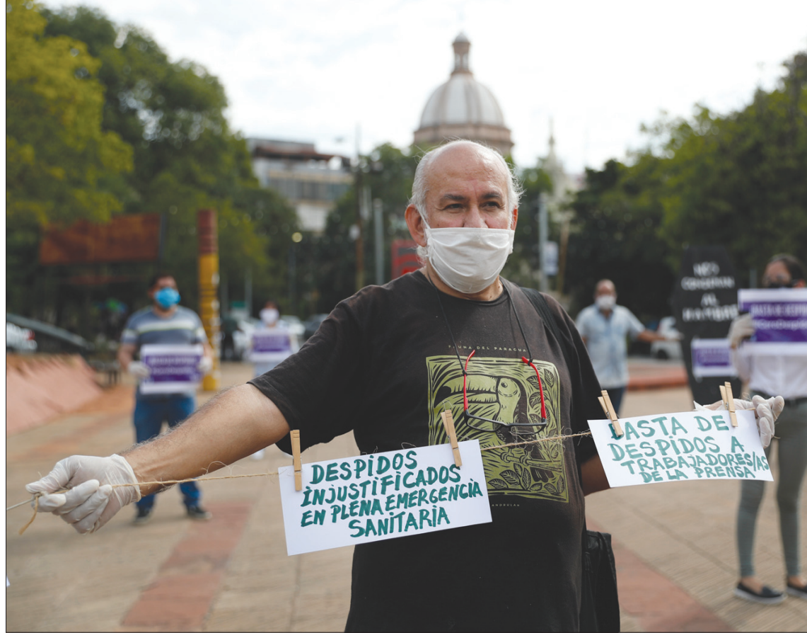
صحافي من الباراغواي يحمل لافتتين كتب عليهما «إقالات تعسفية خلال الجائحة» و«وقفوا قطع أرزاق الصحافيين»

واشنطن، إيلي يوسف أكثر من ربع المرسلين قالوا إنهم يفكرون إلى المهدات المناسبة للعمل من المنزل في ظروف أمنة، وسط إجراءات الإغلاق التي طبقت على نطاق واسع لإبطاء انتشار الفيروس.