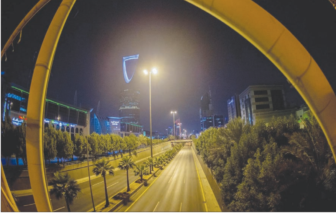
كبار تنفيذيي الشركات السعودية المدرجة جنوا تعويضات ضخمة لا ينتظر تكرارها هذا العام مع جائحة «كورونا»

ووفقاً للمنصة، برز كبار التنفيذيين في قطعي البنوك والمواد الأساسية كأكثر القطاعات استحواذاً على التعويضات بـ445 مليون و269 مليون ريال على التوالي، فيما سجل قطاع البنوك والاتصالات أكثر الشركات من حيث معدل تعويضات الفرد بـ7,1 مليون و6,3 مليون ريال للفرد على التوالي. وأوضح المسح أن نحو 102 شركة قد زادت في التعويضات المصروفة لكبار التنفيذيين في