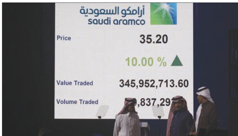
زاد إدراج «أرامكو» من جاذبية سوق الأسهم السعودية

يشار إلى أن إدراج عملاق صناعة النفط العالمي «أرامكو» زاد من جاذبية سوق الأسهم المحلية، الأمر الذي قاد السوق المالية السعودية إلى تصدّر اهتمامات المستثمرين العالميين والمحليين، حيث باتت السوق المالية اليوم واحدة من أكثر القنوات الاستثمارية قدرة على جذب الاستثمارات العالمية والمحلية. وحقق إدراج «أرامكو» قفزة قوية على صعيد القيمة السوقية لتعاملات السوق المالية السعودية، الأمر الذي جعل سوق الأسهم السعودية واحدة من أضخم 10 أسواق مالية في العالم أجمع.