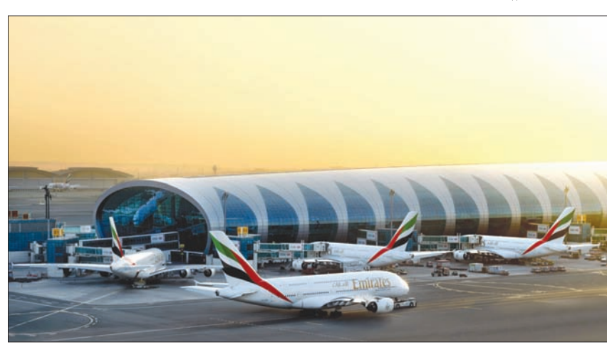
«طيران الإمارات» على أهبة الاستعداد لاستئناف العمل فور أن تسمح الظروف

واكد: «لا شك في أن جائحة كوفيد - 19 سيكون لها أثر بالغ على أرباحنا خلال السنة المالية الجارية (2020 - 2021)، نظراً لتعليق رحلات الركاب مؤقتاً منذ 25 مارس (آذار) الماضي، وكذلك تآثر أعمال دناتا نتيجة لتوقف حركة الطيران والطلب على السفر عبر العالم. وبينما نخطط حالياً لاستئناف عملياتنا، فإننا نواصل اتخاذ إجراءات صارمة لضبط النفقات، وإنهاء خطوات ضرورية أخرى لحماية أعمالنا». وقال الرئيس الأعلى للرئيس التنفيذي لطيران الإمارات: «نتوقع أن يمضي 18 شهراً على الأقل، وربما أكثر، قبل أن يعود الطلب على السفر إلى طبيعته. ونحن حالياً على تواصل دائم مع واضعي السياسات ومختلف الأطراف ذات الصلة التي تعمل على تحديد معايير تضمن صحة وسلامة المسافرين والمشغلين في عالم ما بعد الجائحة. وحتى ذلك الحين، فإن طيران الإمارات وبناتنا تتفان على أهبة الاستعداد لاستئناف العمل وخدمة عملائنا فور أن تسمح الظروف بذلك».