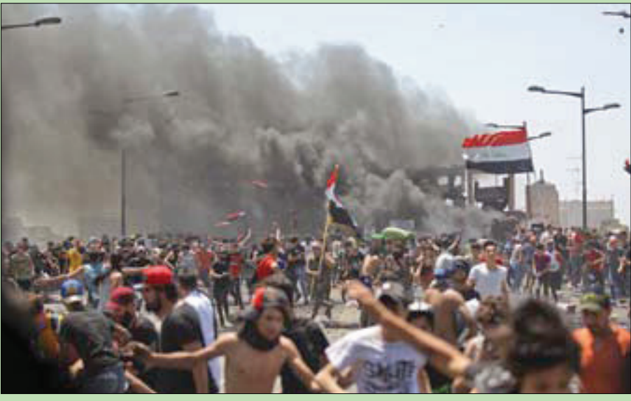
محتجون خلال مواجهات مع قوات الأمن العراقية على جسر الجمهورية في بغداد أمس