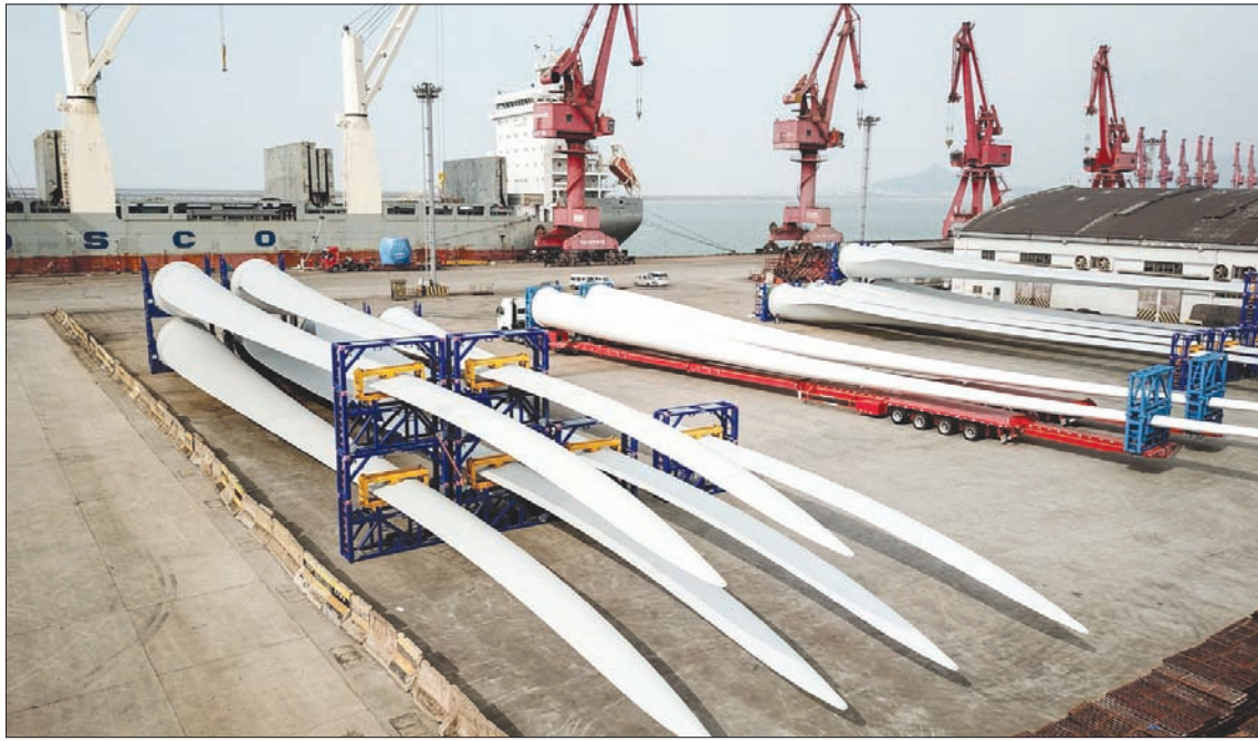
شفرات توربينات رياح تنتظر التصدير في ميناء بشرق الصين الخميس الماضي

على توازن أساسي في الربع الأخير، مع تدفقات مستقرة لرأس المال عبر الحدود. واستشهدت المتحدثة بالأسس الاقتصادية السليمة وتحركات الإنفاق للبلاد، وقالت إنه مع عودة الأنشطة التجارية والإنتاجية إلى مسارها تدريجياً، سيكون ميزان المدفوعات مستقراً مستقبلاً. وأمام هذه المعطيات، كانت كبيرة خبراء الاقتصاد في صندوق النقد الدولي، قد دعت صناع السياسة النقدية والاقتصادية في العالم إلى تطبيق سياسات نقدية ومالية موجهة لمساعدة المستهلكين والشركات في مواجهة تداعيات تفشي فيروس كورونا المستجد (كوفيد - 19). وكانت كريستينا غورغيغا رئيسة صندوق النقد قد ذكرت أن النظرة المستقبلية للاقتصاد العالمي تتحول نحو «المزيد من السنيناريوهات الراهية»، مع الانتشار واسع النطاق للفيروس وصعوبة التنبؤ بآثاره، ورصد صندوق النقد الدولي 50 مليار دولار كمساعدة الدول في التعامل مع «كورونا» بما في ذلك 10 مليارات دولار من دون فائدة للدول الأشد فقراً.