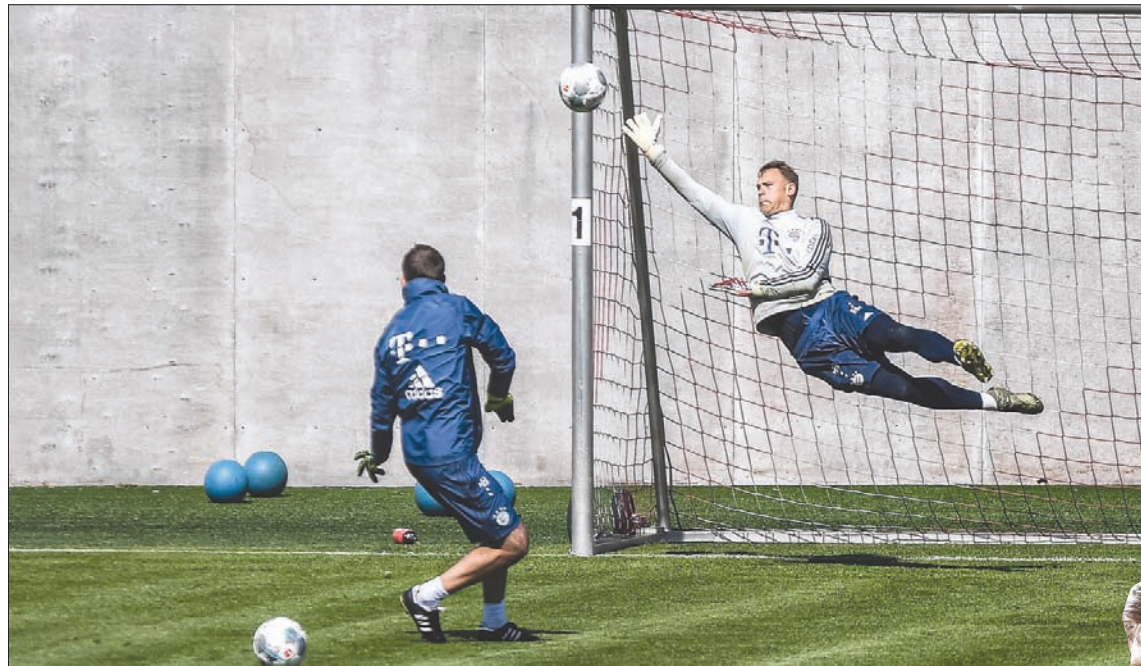
نوير حارس الباييرن خلال التدريبات استعداداً لمواجهة أونيون برلين الأحد

الخطر قدر المستطاع». ومن المقرر أن تبحث الأندية الإنجليزية اليوم في احتمالات استكمال الموسم، على أن يأتي ذلك في أعقاب إعلان حكومي متوقع بشأن إجراءات تدريجية لتخفيف الإغلاق المفروض في البلاد للحد من تفشي الفيروس. ومن الخطوات المقترحة لاستكمال الموسم، إقامة المراحل المشاركة في الملاعب محادية، في خطوة تلقى اعتراض بعض الأندية لا سيما منها التي تحتل مراكز متأخرة في ترتيب البريميرليغ. ورأى باربر، وهو أحد المعارضين لفكرة الملاعب المحادية، أن الأهم بالنسبة إلى البطولة هو معرفة المراحل المختلفة لمعاودة الأندية تدريباتها. وأوضح «من الأمور التي سألنا سلطات الدوري الإنجليزي عنها هي خطة كاملة لجميع مراحل استئناف اللعب، نريد استعادة اللاعبين للمشاركة في التدريبات في مجموعات صغيرة، ثم يتعين عليهم بعد ذلك الاحتكاك الجسدي خلال هذه التدريبات قبل التمارين لخوض المباريات».