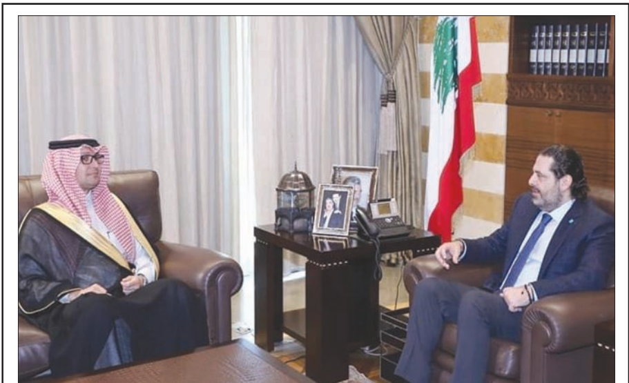
الحريري مستقبلاً البخاري