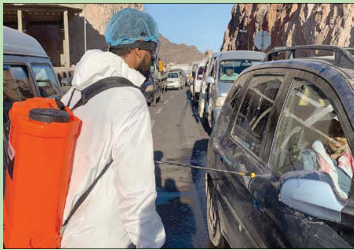
عامل يمني يرش سيارة بمادة معقمة ضد «كورونا» في ضاحية الملا بعدن أمس