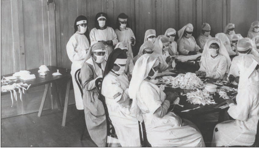
متطوعات مع الصليب الأحمر يصنعن كامات في كاليفورنيا عام 1918

من الطاعون. وقال مؤرخ بيل فرانك ستونود معلقاً على الإحراق المتعمد: «لم يكن أحد يعرف ما إذا كان ذلك سيحدث فارقاً»، أم لا.