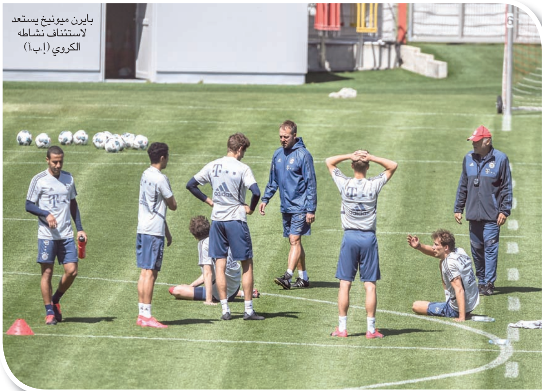
بايرن ميونخ يستعد لاستئناف نشاطه الكروي

لندن، آندي براسل كما كان متوقفاً، أعلن الدوري الألماني الممتاز استئناف مبارياته في النصف الثاني من شهر مايو (أيار) الحالي، ليكون ذلك أول دوري في الدوريات الأوروبية الخمسة الكبرى يستأنف منافساته التي توقفت نتيجة تفشي فيروس كورونا. وجاء هذا القرار بعدما منحت الحكومة الفيدرالية الضوء الأخضر للدوري الألماني الممتاز لاستئناف مبارياته وتحتدي الجدول الزمني بنفسه. وقد وافق وزير الصحة الألماني، ينس شبان، على الخطة التفصيلية التي وضعها الدوري الألماني الممتاز خلال الأسبوع الحالي فيما يتعلق بإجراءات السلامة والنظافة. لكن «الشيطان يكمن في التفاصيل»، كما يقال دائماً، حيث انتهى شبان بالتأكيد على أن وضع خطة يختلف تماماً عن تطبيقها، وهذا هو بالضبط ما اكتشفه الدوري الألماني الممتاز وأنديته. فقد أكد الدوري الألماني الممتاز يوم الإثنين على أنه كانت هناك عشرة اختبارات إيجابية للإصابة بفيروس كورونا، من بين 1,724 اختبار تم إجراؤها، وهو الأمر الذي أعطى مصداقية لمزاعم الدوري الألماني الممتاز بأن هدف الفحص يتمثل في «توفير أمان إضافي وحماية للاعبين». وأيد هذا الأمر الدكتور