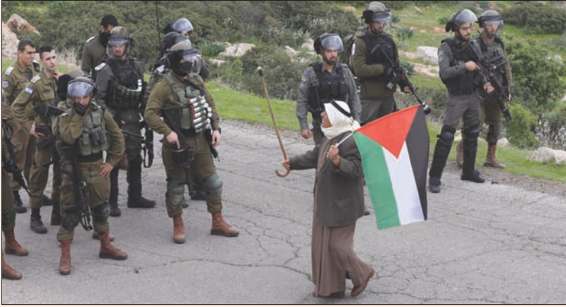
متظاهر يحمل العلم الفلسطيني في مواجهة قوات إسرائيلية قرب غور الأردن فيراير الماضي