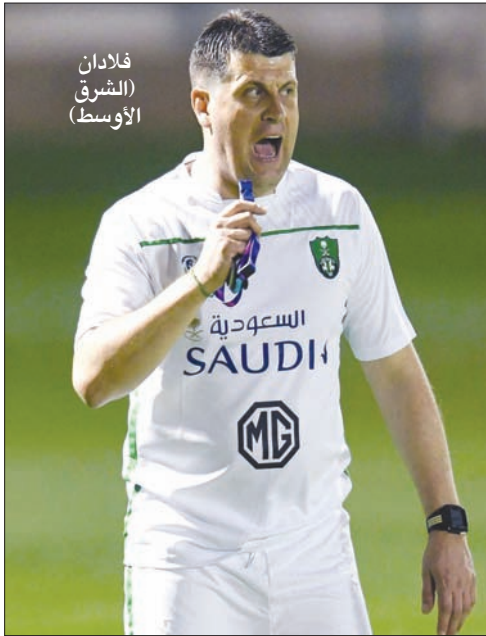
فلادان (الشرق الأوسط)

يذكر أن مسؤولي النادي الأهلي اتفقوا مع الجهاز الفني للفريق الأول لكرة القدم واللاعبين الأجانب قبل مغادرتهم جدة إلى بلادهم بسبب توقف الأنشطة الرياضية على أن تكون العودة منتصف شهر يوليو (تموز) المقبل بشكل مبدئي قبل أن يتم إشعارهم مؤخراً باحتمالية تقديم عودتهم إلى مطلع نفس الشهر بعد ومفضلاً في حال تعذر إقامة معسكر إعدادي خارجي خلال الفترة المقبلة للمسابقات الرياضية المحلية في حال تحسين الأوضاع الصحية ورفع القيود الاحترازية والوقائية لمكافحة فيروس كورونا.