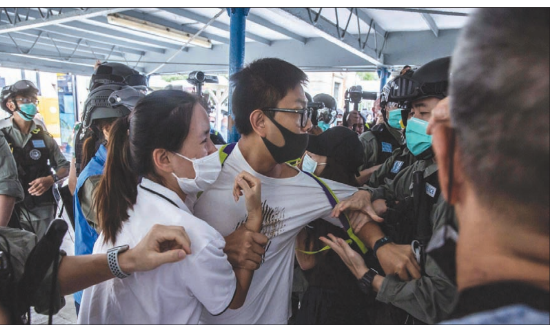
تجدد المواجهات بين الشرطة والناشطين المتدينين بالديمقراطية في منطقة تسييم شا تسو الساحلية بهونغ كونغ أمس

وتواصلت الاعتقالات والمحاکمات فيما أثار مكتب بكين في المدينة خلافاً دستورياً الشهر الماضي بإعلانه عن دور أكبر لبكين في إدارة شؤون هونغ كونغ. وأثار خطط لتعديل قانون يحظر إهانة النشيد الوطني الصيني، عراقاً في المجلس التشريعي الجمعة. ولج كبار المسؤولين في بكين إلى أن شرعي المعارضة الذين يعرفون صدور القانون، يمكن محاكمتهم، ودعوا أيضاً إلى تمرير قانون جديد لمنع الفتنة.