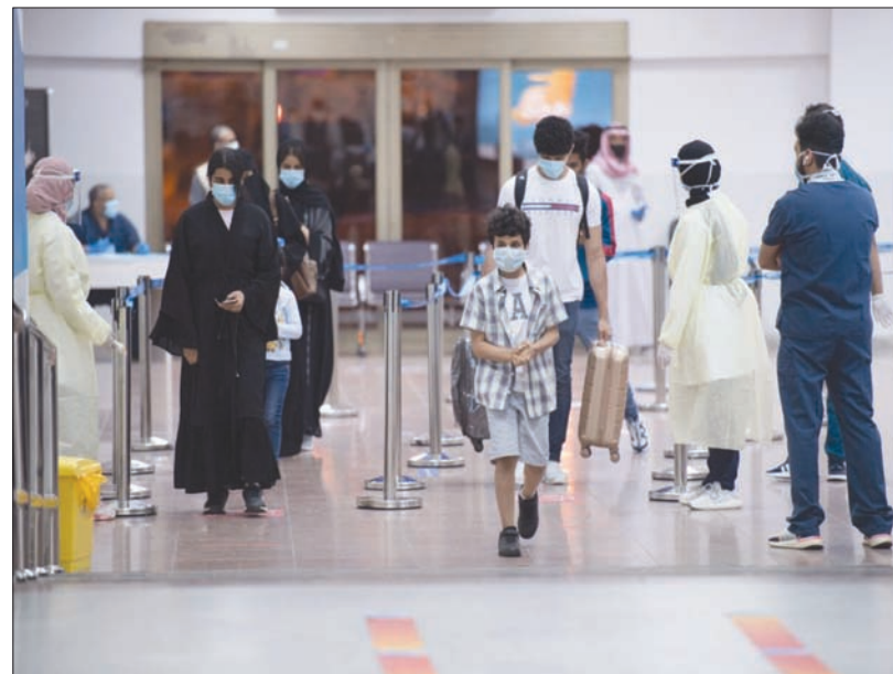
عائذون من الخارج أعربوا عن امتنانهم للتيسير الحكومي لعودتهم (واس)

عن رفع الإجراءات الاحترازية الإضافية عن محافظة صامطة بمنطقة جازان، جنوب المملكة، اعتباراً من اليوم (الاثنين)، والتجول لقضاء احتياجاتهم، من الساعة التاسعة صباحاً وحتى الساعة الخامسة مساءً، واستمرار عمل الأنشطة المستنقاة، والعمل بالإجراءات الوقائية الاحترازية الصحية، التي سبق الإعلان عنها. وكانت وزارة الداخلية أصدرت في الثامن عشر من أبريل (نيسان) الماضي قراراً يقضي بمنع التجول على مدار 24 ساعة بمحافظة صامطة والداير في منطقة جازان، فيما جاء في الإجراءات الاحترازية بالنسبة لبوابة الدخول إلى المدن في أوقات أكثر من الأوقات سابقاً.