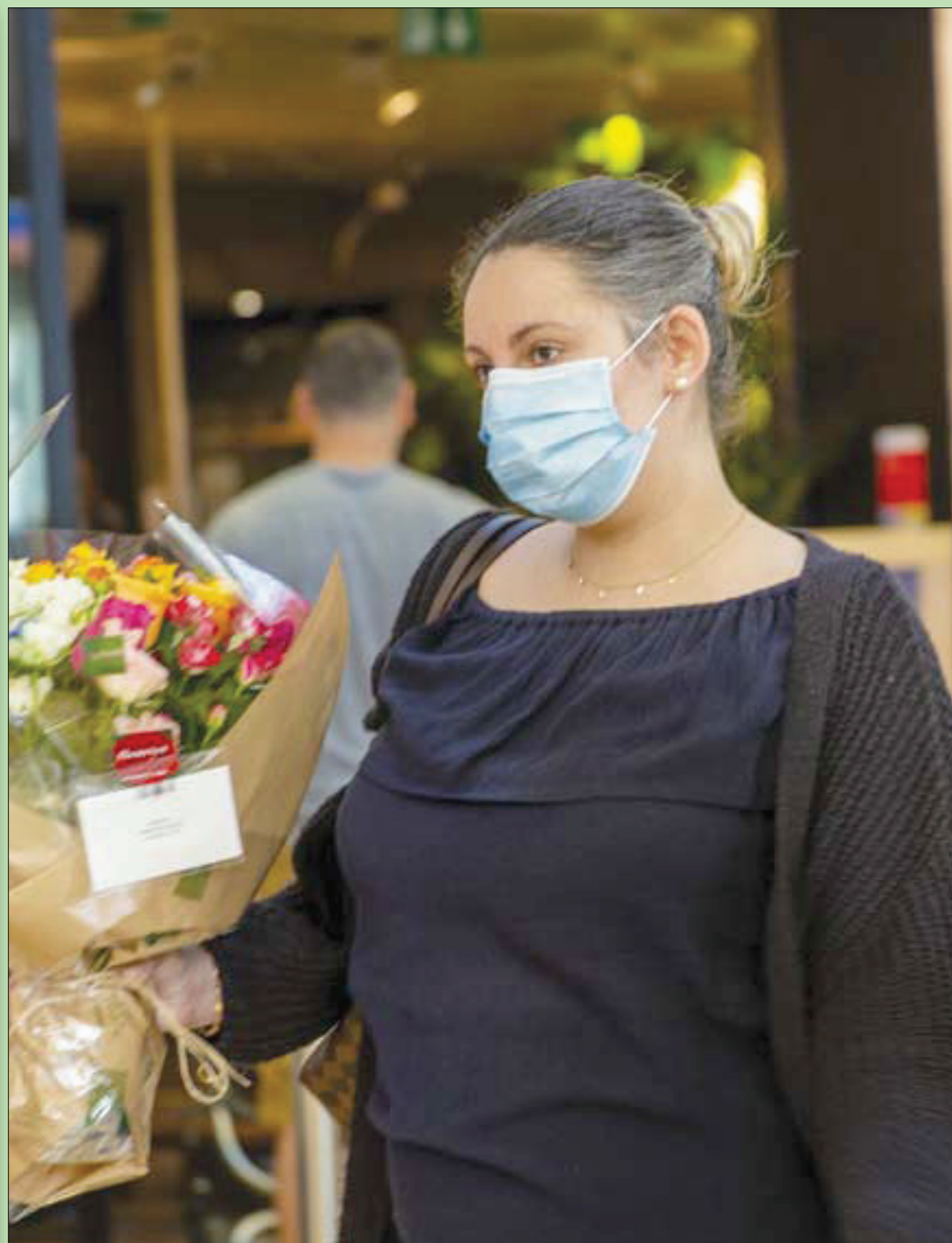
سويسرية تحمل باقة زهور عيد الأم الذي احتفلت به جنيف أمس

مهمة هذا الحلف الثلاثي الخبيث نترويح رواية «الإخوان»، بقناعهم الديمقراطي الزائف، ورواية أو مظلومية القوى الخمينية في الغرب، وتطرفات وهراء اليسار الجديد حول قضايا مثيرة، ليس فقط حرب اليمن واستهداف السعودية والإمارات ومصر بشكل خاص، بل في قضايا مثل «مناصرة وتطبيع» الشوذ الجنسي والتطرف البيئي الخ. والغريب كيف تجد إسلامية صومالية أميركية مثل إلهان عمر نائبة الكونغرس الأميركي تدعخ اليسار الأميركي بنصرتها لقضايا الشوذ! هو تخادم مكشوف وتحالف مشبوه، لم تصنع «فيسبوك» جديداً فيه، سوى المزيد من الانفصاح.