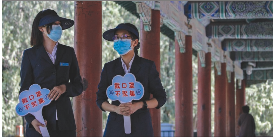
عاملتان صينيتان تحمالان لافتتين كتب عليهما: «ارتدوا الأقنعة، لا تجتمعوا» في بكين أمس

جهاز المخابرات الألماني قوله إن محاولات الصين في بادئ الأمر حجب المعلومات أضاعت على العالم ما بين 6 و 6 أسابيع كان يمكن استغلالها في مكافحة الفيروس. ورفض المقال انتقادات غربية لتعامل الصين مع حالة لي وين لسانغ، وهو طبيب عمره 34 عاماً حاول لفت الانتباه لتفشي الفيروس الجديد في ووهان. وأدت وفاته بمرض «كوفيد-19» التفنسي الناتج عن الإصابة بالفيروس إلى موجة غضب وحزن في الصين. وأفاد المقال بأن لي لم يكن ينهه لخطر، وأنه لم يسجن، كما ذكرت تقارير غربية عدة، لكنه لم يذكر أن لي تعرض لتوبيخ من الشرطة لنشره شائعات. ورغم تحوله إلى «شهيد الوباء» الذي حزن عليه الصينيون، أشار التحقيق في قضية الانتقادات، بعد أن اقترح سحب التوبيخ الموجه له. ورفض المقال اقتراحات الرئيس الأميركي دونالد ترامب، ووزير الخارجية بومبيو، بأن الفيروس يجب أن يطلق عليه اسم «الفيروس الصيني» أو «فيروس ووهان»، وأشار إلى وثائق من منظمة الصحة العالمية تفيد بأن الفيروس يجب ألا يرتبط اسمه بمكان أو بلد.