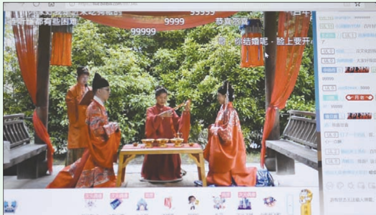
حفل زواج «أولانين» في الصين تابعة الأهل والغرباء على حد سواء