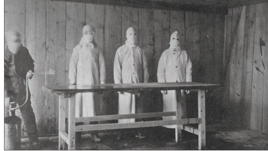
جانب من تعقيم طارئة تشريح في مستشفى يعالج مرضى الطاعون في الصين عام 1910

ضرب الطاعون الدملي العالم عدة مرات خلال الألفي عام الماضية، ليؤدي بحياة الملايين من البشر ويغير مسار التاريخ، لكنه ضاعف الخوف في كل مرة من الوباء التالي. وينجم المرض عن سلالة من البكتيريا تسمى «يرسينيا بيستيس» أو «اليرسينا الطاعونية»، تعيش على البراغيث التي تعيش بدورها على الفئران. لكن «الطاعون الدملي» الذي أصبح يعرف باسم «الطاعون الأسود»