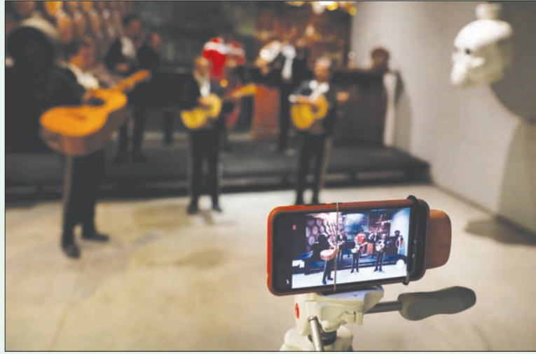
فرقة موسيقية تمارس التبادل الاجتماعي أثناء تسجيلها حفلة على الهاتف للث عبر الإنترنت