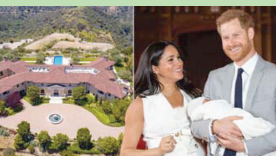
هاري وميغان يقيمان في قصر فاخر ببلوس أنجلوس

وتأير أن أوبرا هي مرشدتهم في هوليوود، ويعمل ميغان وهاري مع أوبرا على فيلم وثائقي بينما كان تايلر قد دخل بشراكة مع قناة أوبرا التلفزيونية OWN في الماضي. وكان قد قال مصدر لـ«دايلي ميل» إن «ميغان وهاري كانا حذرين للغاية لإبقاء مكان إقامتهما سرياً للغاية». ويعتبر قصر بيغفري ريدج المكان المناسب للاستعداد عن الأناظر، كما أن جيرانه من الأثرياء الذين ينشغلون بأعمالهم لا بالفرزة وإطلاق الشائعات. تقع بيغفري ريدج على مسافة قريبة من مطار Van Nuys الخاص، بالإضافة إلى أكثر المدارس الخاصة المرغوب فيها في لوس أنجلوس. وتندد إيجارات العقارات في بيغفري ريدج من 20 ألف دولار وصولاً إلى 40 ألف دولار شهرياً، وتبلغ قيمة العقار نحو 16 مليون دولار.