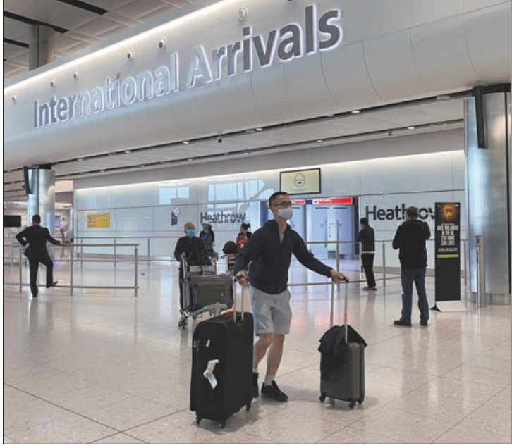
ركاب يصلون إلى مطار هيثرو في لندن أمس

ويولن. وأدى أولئك المسؤولون ترددا في التخلي عن التوصيات الأصلية. وقالت رئيسة حكومة اسكتلندا نيكولا ستورجون على تويتر: «بالنظر إلى اللحظة الحاسمة في مكافحة الفيروس تبقى رسالة اسكتلندا حالياً «ابق في المنزل، انقذ أرواحا». من جهته، اعتبر حزب العمال البريطاني المعارض أن شعار «ابق بقطاً» سيجعل الناس «حائرين». ولعب حصول طفرة في العدوى، تدرس الحكومة إيجار المسافرين القادمين من المملكة المتحدة على قضاء أسبوعين في الحجر، وهو ما يثير مخاوف قطاع الطيران المتضرر من الوباء، واستعداداً لتخفيف الحجر، رفعت الحكومة قدرتها على إجراء الفحوص وتتبع المصابين، وترغب في الوصول إلى 200 ألف اختبار يومي بحلول نهاية الشهر. وعلى غرار عدة دول، ستعتمد المملكة المتحدة على تطبيق يتتبع المصابين ومخالطهم، يتم حالياً اختبارها في جزيرة وايت (جنوب