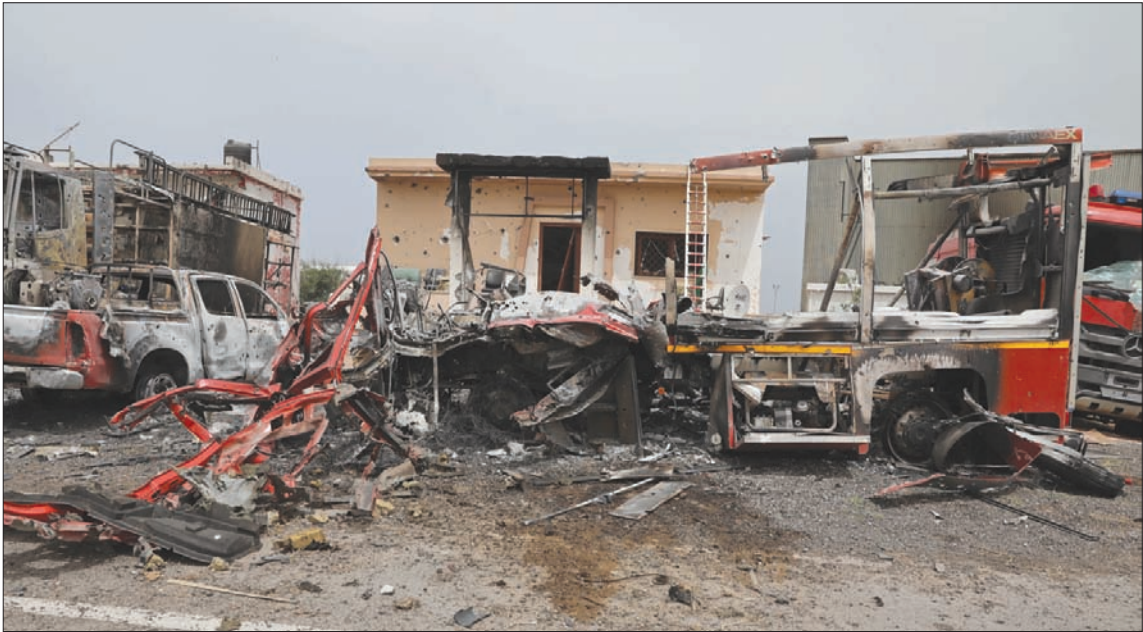
مطار معيطة الدولي، الذي أصيب بالقصف أمس

اشخاص في الطيران التركي المسير على مدينتي الرجبان والزنتان. وبدوها، أعلنت قوات الوفاق المشاركة في عملية «بركان الغضب» سقوط 3 قتلى و12 جرحياً، من بينهم 3 أطفال، نتيجة القصف الذي اتهمت قوات الجيش بشنه مساء أول أمس، وادى إلى إلحاق «أضرار واسعة في مطار معيطة ومرافقه، ومنازل وممتلكات المواطنين وسياراتهم»، على حد قولها.