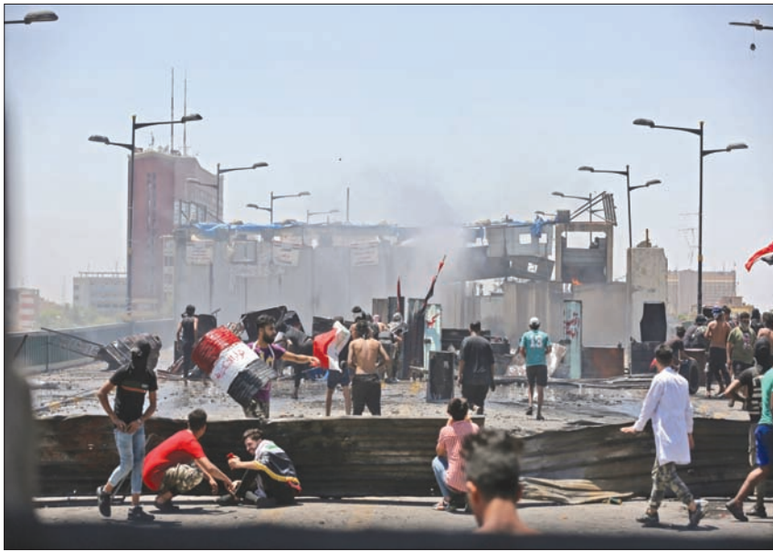
مواجهات بين قوات الأمن ومظاهرين ضد الحكومة العراقية الجديدة على جسر «الجمهورية» في بغداد أمس

الداخلي وتراكم المشاكل». وبشأن الملفات الخارجية، يقول الخربيط إن «مشاكل الخارج سوف يكون الطريق فيها مهماً إلى حد كبير، لكنه طويل، خصوصاً أن الصراع الأميركي - الإيراني قد يكون وصل إلى مراحل من التفاهم قد لا يكون الدور العراقي فيها كبيراً، لكنها سوف تنعكس إيجاباً على العراق في عهد الكاظمي».