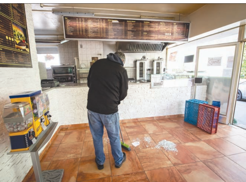
إزالة آثار الاعتداءات على محل كباب في منطقة فالديكراببيرغ بولاية بافاريا (د.ب.أ)

اعترف بجرائمه ونفى أن يكون معنياً بالصراع مع الأكراد