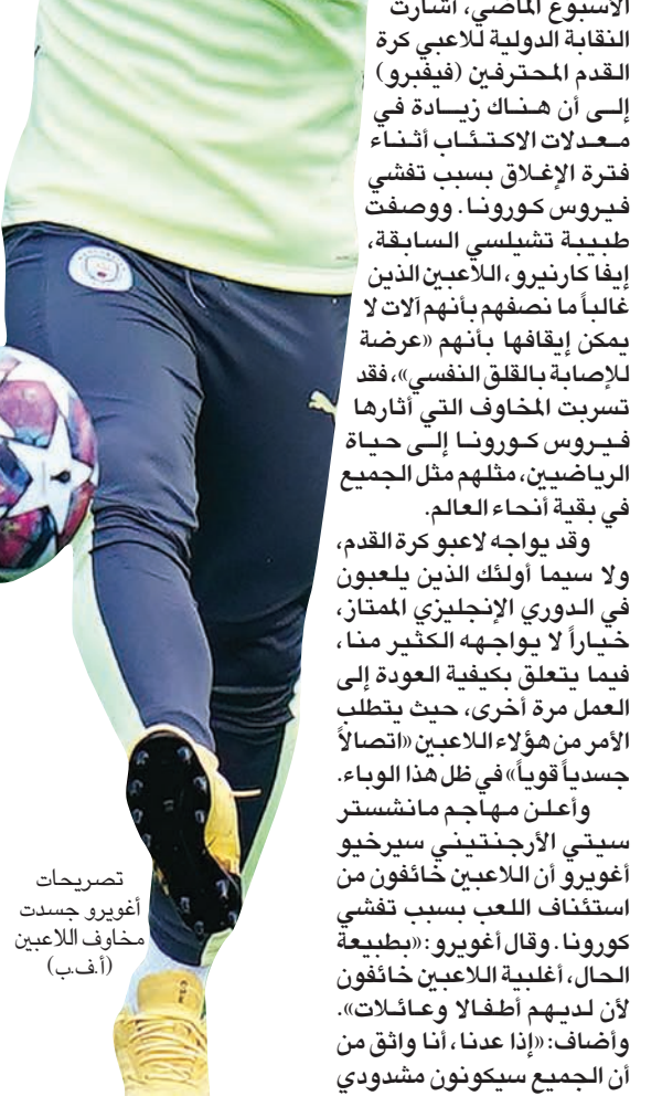
تصريحات أغويرو جسدي مخاوف اللاعبين

بإد توقع المعينون خسائر بقيمة ما يقارب مليار جنيه إسترليني (1,2 مليار دولار). إن العائق الذي يتعين على الرياضيين أن يتخلصوا منه نفسياً ليكونوا مستعدين وتجعل اللاعبين أكثر عرضة للإصابة بالمرض وأكثر عرضة