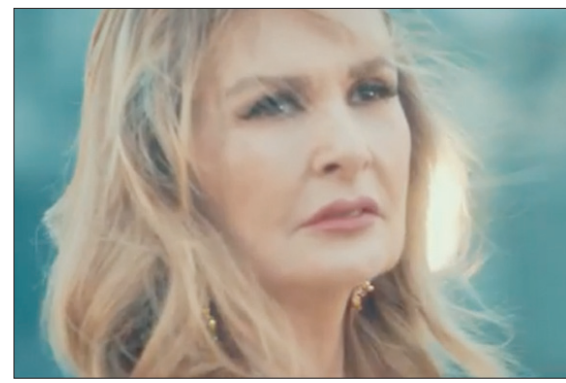
يسرا في «خيانة عهد»

لا يزال مفهوم الموسيقى (التي تُسمى خطأ التصويرية) غير واضح المعالم بالنسبة للعديد من صانعي المسلسلات. وليست كذلك بالنسبة لكثير من الأفلام السينمائية المنجحة في ربوع العالم العربي أيضاً، لكن عندما يأتي دور استخدامها في المسلسلات تتحول من أداة تم تشويه استخدامها أساساً، إلى أداة تعذيب لا يُطاق.