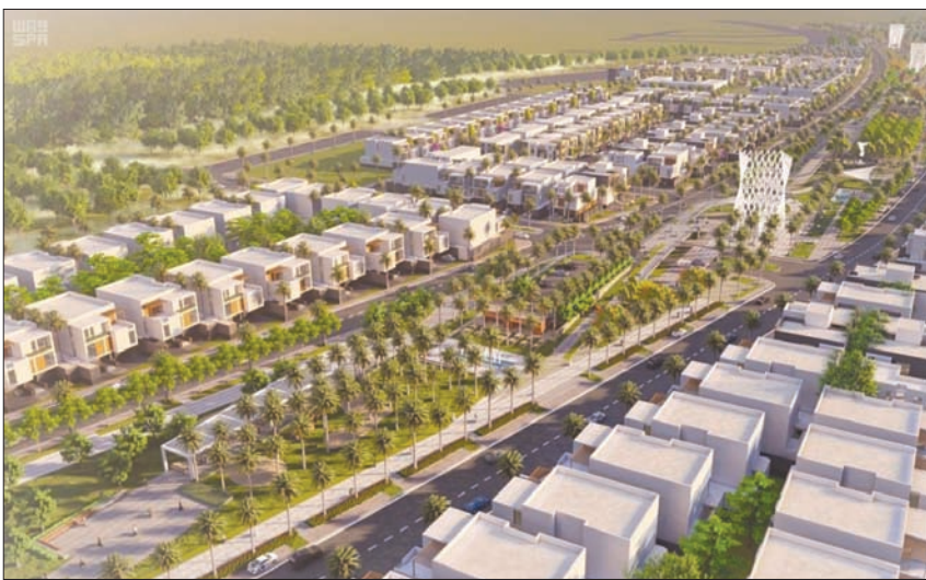
الموافقة على مشروع عمراني عملاق في المدينة المنورة يعزز الواجهة الحضارية الجذابة للمنطقة (الشرق الأوسط)

وأصدرت أمانة المدينة المنورة تصريحا لبناء مشروع جادة السكب العمراني الذي يتكون من نحو 2962 وحدة سكنية متنوعة النماذج والمساحات على مساحة أراض تقارب نحو 740 ألف متر مربع في المدينة المنورة، حيث تمتاز بتصاميم المشروع بواجهات جذابة تحتوي على 766 عمارة سكنية كل مبنى على ثلاث شقق تستغل كل شقة في دور منفصل بتوزيع داخلي مدرّس، بحيث يعطي استجابة للحركة والاستفادة من الارتداد المعماري بعمل مساحات خضراء، كما تم