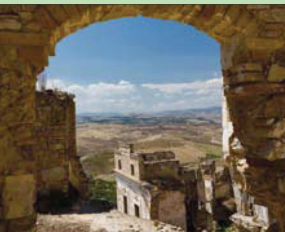
قرية إيطالية هاجر أهلها إلى أمريكا الشمالية في القرن العشرين

تضم إيطاليا 5800 قرية يقل عدد سكانها عن خمسة آلاف نسمة. ووفقاً لبيوري، فإن أكثر من 2300 من تلك القرى مهجورة. وتظهر الأرقام الرسمية أن العديد من الأراضي الصغيرة تقلصت بأكثر من النصف خلال السنوات الخمسين الماضية، من لغوسولو في شمال إيطاليا إلى كاسالفينكو سيكولو التي تعود إلى القرون الوسطى في جنوب صقلية. ويمكن للحكومة «تبنيها» وإغراء أشخاص للمجيء والسكن