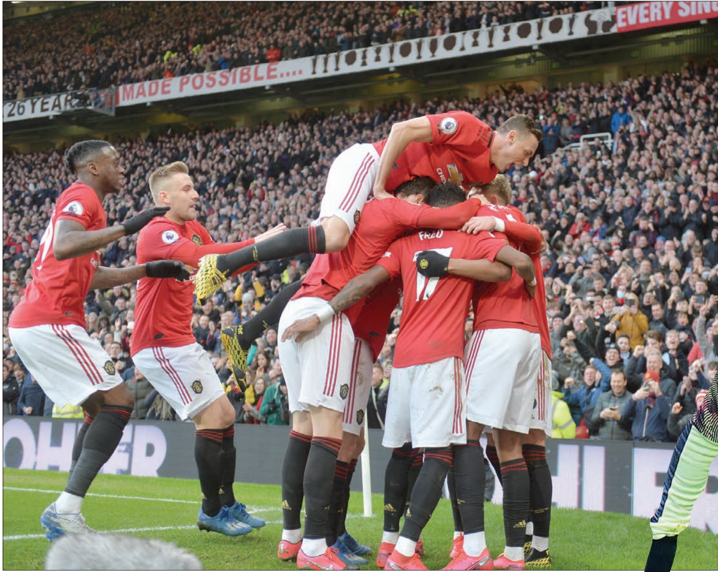
صداقة اللاعبين في الملاعب غالباً ما تكون من خلال التماس وليس اللعب فقط