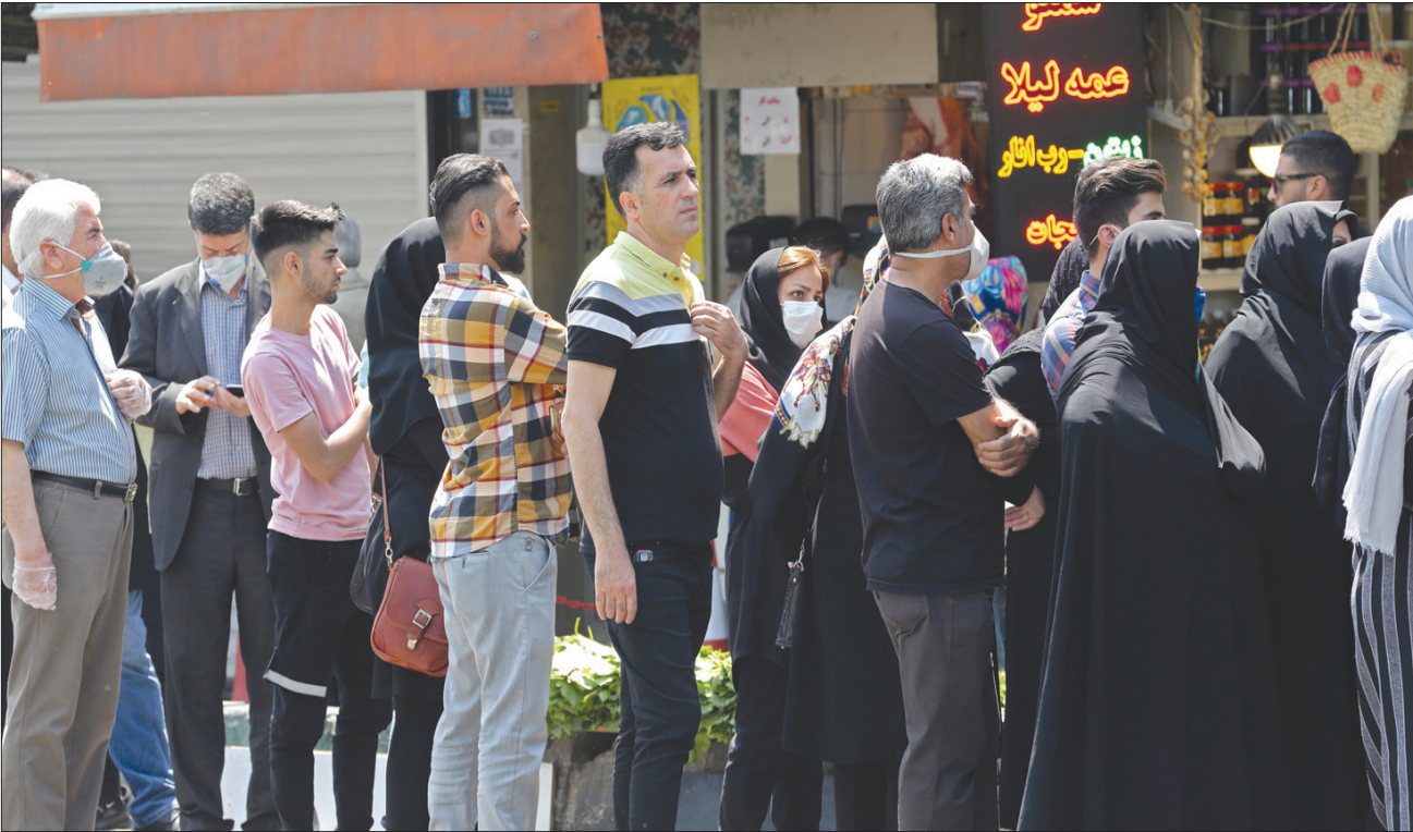
إيرانيون يصطفون من دون تباعد أمام مكتب صرافة في طهران أول من أمس (أ.غ.ب)

لندن - طهران، الشرق الأوسط تتجه الحكومة الإيرانية لإعادة افتتاح المدارس الأسبوع المقبل وسط تحذيرات صدرت أمس من موجة جديدة من فيروس «كورونا» المستجد إضافة بالوباء بعد نحو شهر على بدء تخفيف إجراءات الإغلاق التي فرضت لفترة أسبوعين في أنحاء البلاد.