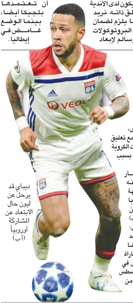
ديببي قد يرحل عن ليون حال الاعتاد عن المشاركة أوروبياً

ميسي عود تدريبات منفردة في ملعب برشلونة