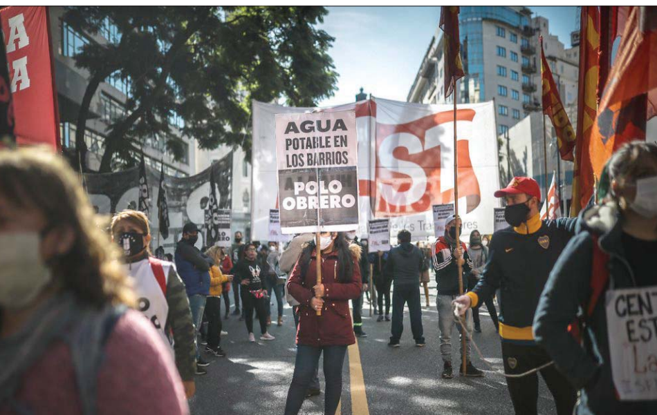
متظاهرون في العاصمة الأرجنتينية احتجاجاً على الوضع الاقتصادي

ويقول الاقتصاديون إنه إذا كانت الأيام التي نمر بها الآن أوقاتاً عادية، فمن غير المنطقي أن تحصل الأرجنتين على التقاضي في المحاكم الأميركية. ونهبت جميع المكاسب التي حققها الأرجنتين في الحد من الفقر، خلال العقد الماضي، إلى الإتحاد المعاكس، ولذلك سعى الرئيس ماكري للحصول على قرض بقيمة 57 مليار دولار من صندوق النقد الدولي، ونحولت النظررة القاتمة للأرجنتين إلى كارثة، بعد أن جرى الإعلان عن إصابة البلاد بجائحة فيروس كورونا الجديد في مارس