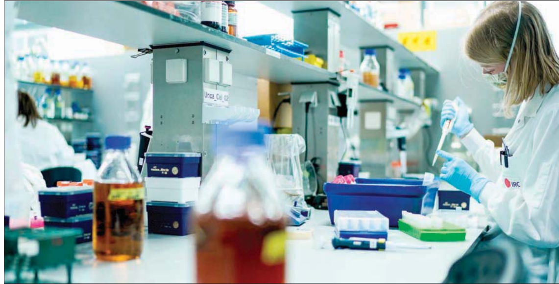
باحثة فيروسات تعمل على استخراج مضادات أجسام في مختبر جامعة غنت البلجيكية

القاهرة، حازم بدر حصل على موافقة أخيرة لإجراء تجربة عشوائية على استخدامه مع المرضى.