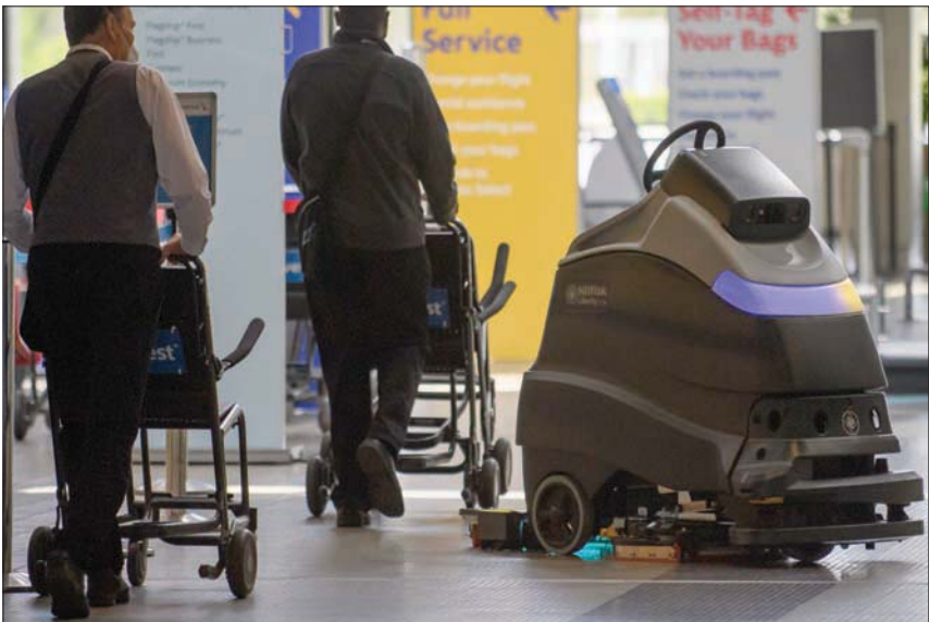
بدأ بعض المطارات مثل مطار بيتسبرغ في بنسلفانيا الأمريكية باستخدام أجهزة روبوت من أجل تعقيم الأرضية ودورات المياه على مدار الساعة

تصاريح ركوب الطائرات حالياً سوف تكون من مخلفات الماضي لسهولة نقل العدوى منها. وسوف يحمل الركاب تذكرته الصحية للركاب، والتي تحتوي على معلومات شخصية، ومنها رقمها هاتفي الجوال. والخلاصة أن مستقبل السفر الجوي سوف يعتمد على قواعد جديدة، تشمل إلى جانب التأمين الطبي، الصحة للركاب، والتي تحتوي على معلومات شخصية، ومنها رقمها هاتفي الجوال. والخلاصة أن مستقبل السفر الجوي سوف يعتمد على قواعد جديدة، تشمل إلى جانب التأمين الطبي، الصحة للركاب، والتي تحتوي على معلومات شخصية، ومنها رقمها هاتفي الجوال.