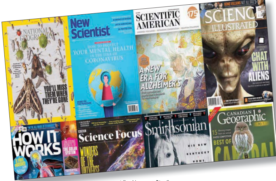
البيئة في مجلات الشهر

وباء «كورونا» كان الموضوع الطاغى على أغلب عناوين الإصدارات الأسبوعية الأخيرة لمجلة «نيو ساينتيست» (New Scientist). وهو عنوان: «كيف البحث عن المريض صفر»، وكيف سنخرج من الإغلاق الكامل؟» و«عندما يصيب الفيروس الدول الأقرب يبدأ التحدي العالمي». وعرضت المجلة في أحد مقالاتها ما وصفته بغزو «الغراء الخضراء»؛ حيث تواجه 35 دولة حول العالم، من الولايات المتحدة غرباً إلى أذربيجان شرقاً، انتشار بيغوات «الدرّة الملوّقة» بعيداً عن مواطنها الأصلية في المناطق المدارية. ويُعتقد أن أباء البيغوات انتقلت إلى هذه البلدان في الأسر، ثم تكثفت مع الأجواء