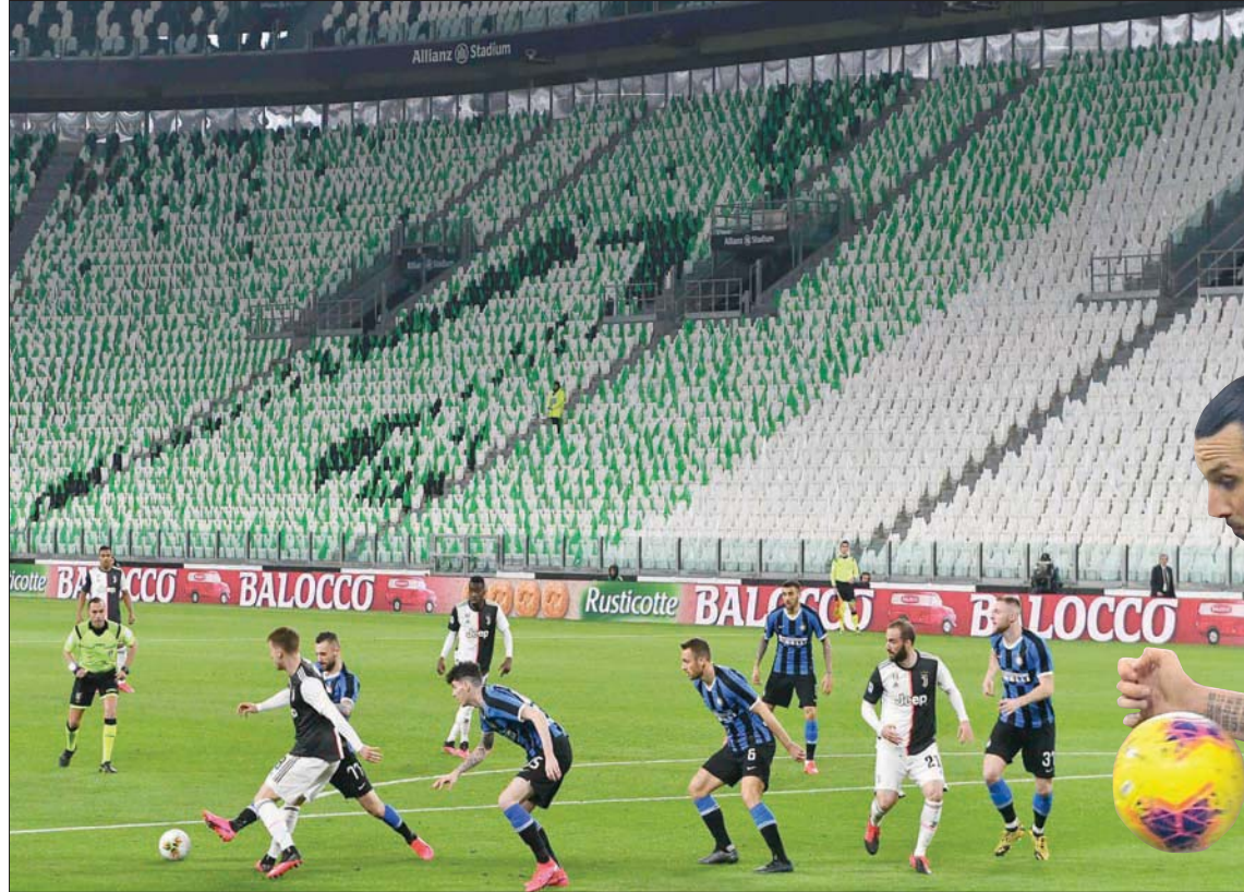
فريقا يوفنتوس وإنتر ميلان في مواجهة في ملعب خال من الجماهير في 8 مارس قبل توقف البطولة بسبب الفيروس

أخطأت فرنسا بالتوقف... وبدأ النجوم الأجانب بالعودة تباعاً إلى إيطاليا مباشرة التدريبات، وبينهم نجم يوفنتوس البرتغالي كريستيانو رونالدو هذا الأسبوع، بينما يتوقع أن يعود قريباً مهاجم فيورنتينا الفرنسي فرانك ريبيري ومهاجم ميلان السويدي زلاتان إبراهيموفيتش، ما سيعزز جاهزية الأندية للعودة للنشاط عندما تسمح السلطات السياسية بذلك. وبدأ قطبا مدينة ميلانو، إنتر وميلان، المتارين في مركز التدريب، وأكد إنتر ميلان أن كل لاعبيه خضعوا لفحوص جاءت نتائجها سلبية. من جهته، أوضح مالديني أن النادي اتخذ إجراءات صارمة، تشمل توزيع اللاعبين في الملعب وإقفال الأماكن المشتركة في مقر التدريب.