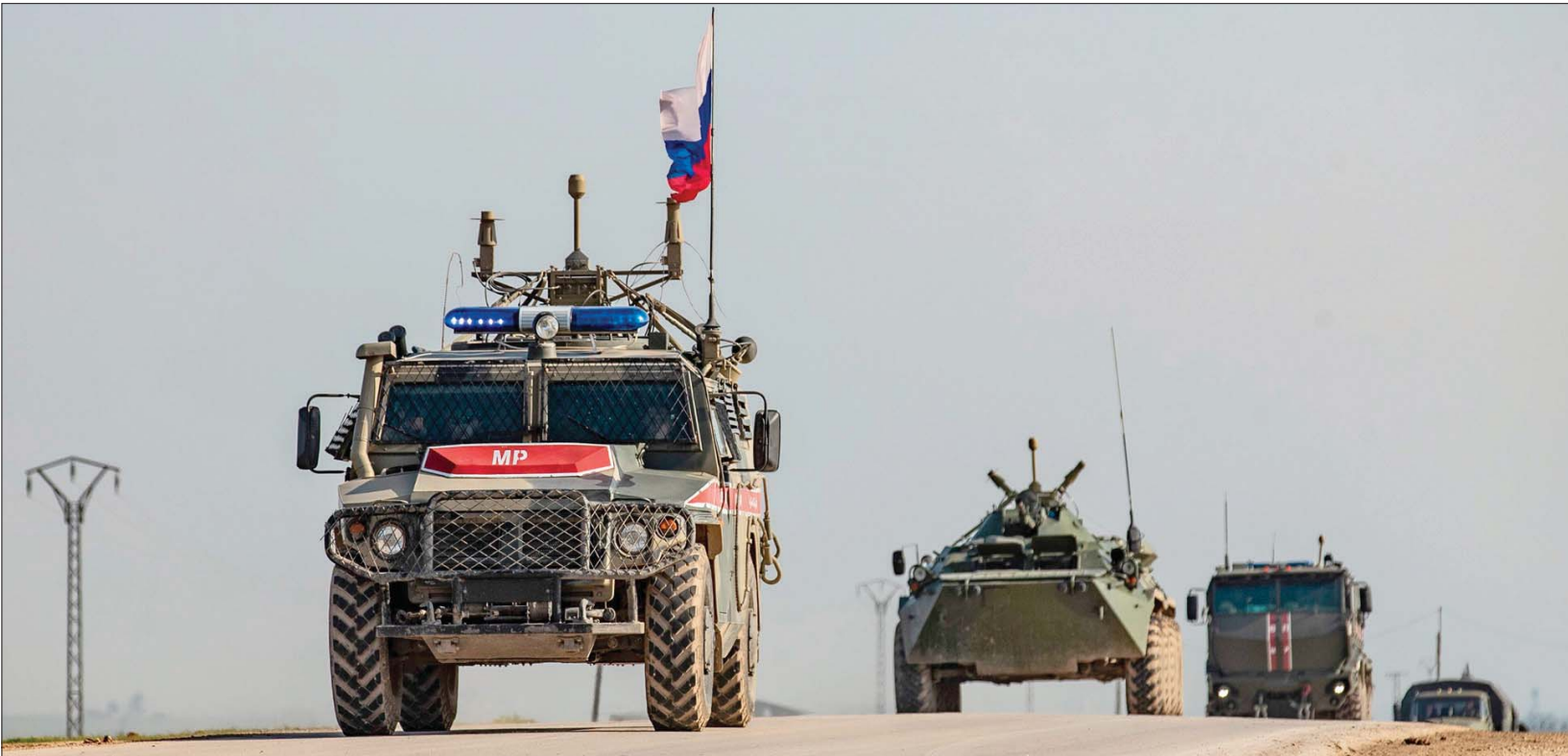
دورية عسكرية روسية في التدريبية بريف الحسكة شمال شرقي سوريا

الواردة تدل على استمرار تدهور الحالة الصحية والوبائية هناك. بعد إغلاق الحدود السورية-الأردنية في إطار التدابير لمكافحة انتشار عدوى فيروس كورونا، وفقد اللاجئين فرصة الحصول على رعاية طبية مؤهلة. وفي الوقت نفسه، لا تستطيع الوكالات الإنسانية التابعة للامم المتحدة إنشاء قنوات بديلة لتقديم المساعدة الطبية بسبب عدم وجود ضمانات أمنية». على صعيد آخر، احتفل