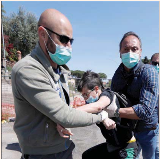
مدرية، شوقي الرئيس الشرطة الإيطالية تعتقل أحد المتظاهرين خارج سجن بروما الشهر الماضي

منذ أن انقضت جائحة «كوفيد-19» على الشمال الإيطالي وقصمت ظهر أحد أفضل الأنظمة الصحية في العالم ووضعت القوة الاقتصادية والصناعية الثالثة في الاتحاد الأوروبي في حال من الإغماء، انسدل الخوف على المشهد الإيطالي الذي راح يتلبّد بالقلق من المستقبل على وقع الخسائر البشرية والمادية الفادحة بشكل لم تعرفه البلاد منذ الحرب العالمية الثانية.