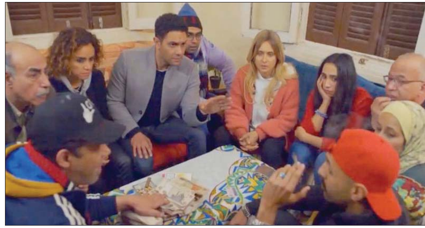
لقطة من مسلسل «ب100 وش»

تدور قصة العمل حول «سكير»، الفنانة التي تعمل «كوافرة» لكنها تحترق للعمل بغرض الإنفاق على والديها وشقيقها، ليكتشفها «عمر» (أسرياسين) مصادفة في أثناء قيامه بالنصب أيضاً داخل متجر الجواهرات، ويبدأ في تتبعها، ثم تبدأ الوسيلة من المصادفات بينهما، ليجتمعاً معاً على تجهيز لعملية نصب كبرى، وتبدأ العصابة في التوسع، ويضم لها أعضاء جدد، ونضم معهم في التخطيط، ونخسب من فشل العملية، وهنا، يجربنا