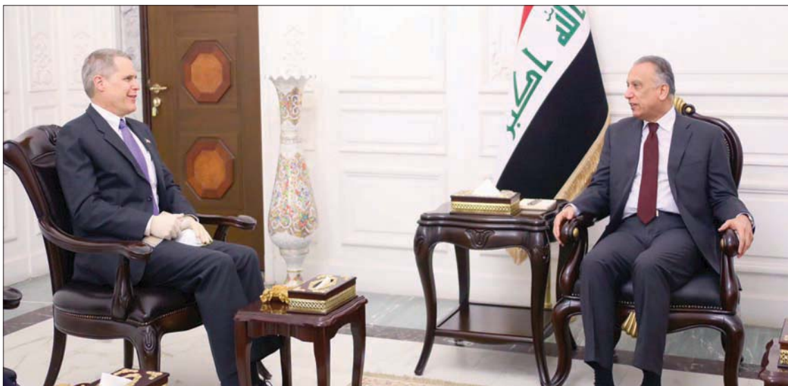
الكاظمي مستقبلاً سفير الولايات المتحدة ماثيو تولر في بغداد أمس (المتكبر الإعلامي لرئاسة الحكومة العراقية)

استقبل رئيس الحكومة العراقية مصطفى الكاظمي، أمس، ببغداد، سفير الولايات المتحدة ماثيو تولر. وأوضح المكتب الإعلامي لرئيس الوزراء العراقي أن الكاظمي «أكد ضرورة التعاون والتنسيق بين البلدين في المجالات الاقتصادية والأمنية ومواجهة الإرهاب والتحضير للحوار الاستراتيجي بين البلدين والعمل على حفظ الأمن والاستقرار في المنطقة وإبعادها عن المخاطر». كما أشار الكاظمي، بحسب مكتبه الإعلامي، «إلى أن العراق لن يكون والإعداد على أي دولة جارة أو صديقة».