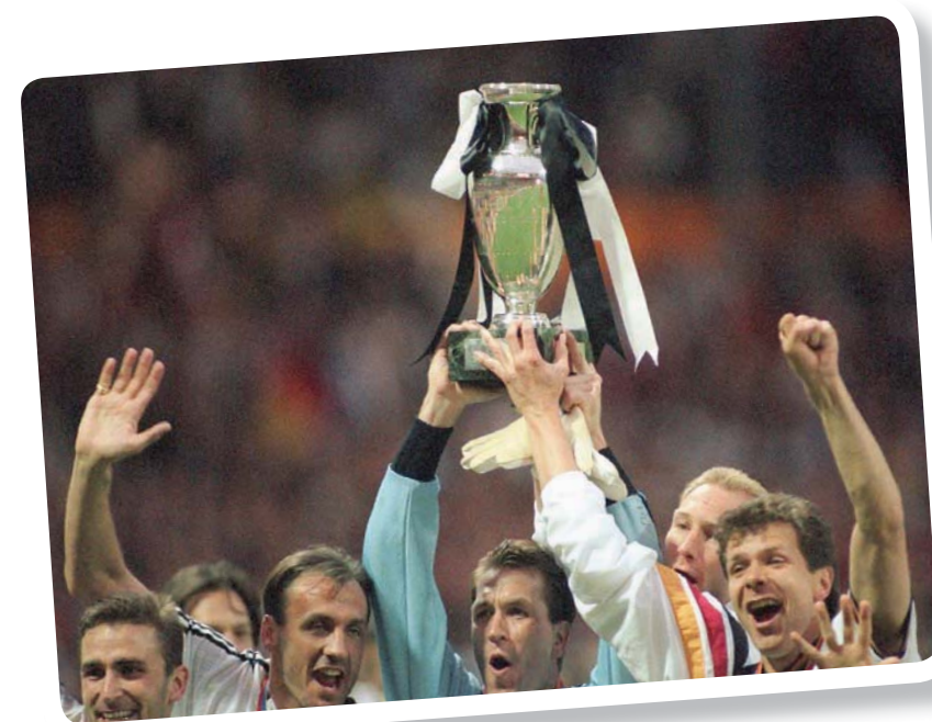
فازت ألمانيا بكأس أوروبا 1996 على حساب تشيكيا بالهدف الذهبي

الذهبي» في 2004. أصبح إجراء التبديل الثالث خلال المباراة متاحاً من دون شروط. اعتمدت تقنية خط المرعى من أجل تحديد ما إذا تم منع حراس المرعى من لمس الكرة باليد في حال اللعب الجميل» وفق الاتحاد الدولي للعبة (فيفا). تم اعتماد الهدف الذهبي الذي يسمح للفريق في حال سجل هدفاً يكسر به التعادل، حتى قبل انتهاء الشوط الإضافيين. بفضل هذه القاعدة، فازت ألمانيا بكأس أوروبا 1996 على حساب تشيكيا وفرنسا على إيطاليا في نهائي البطولة القارية نفسها عام 2000. قبل أن يلغى «الهدف