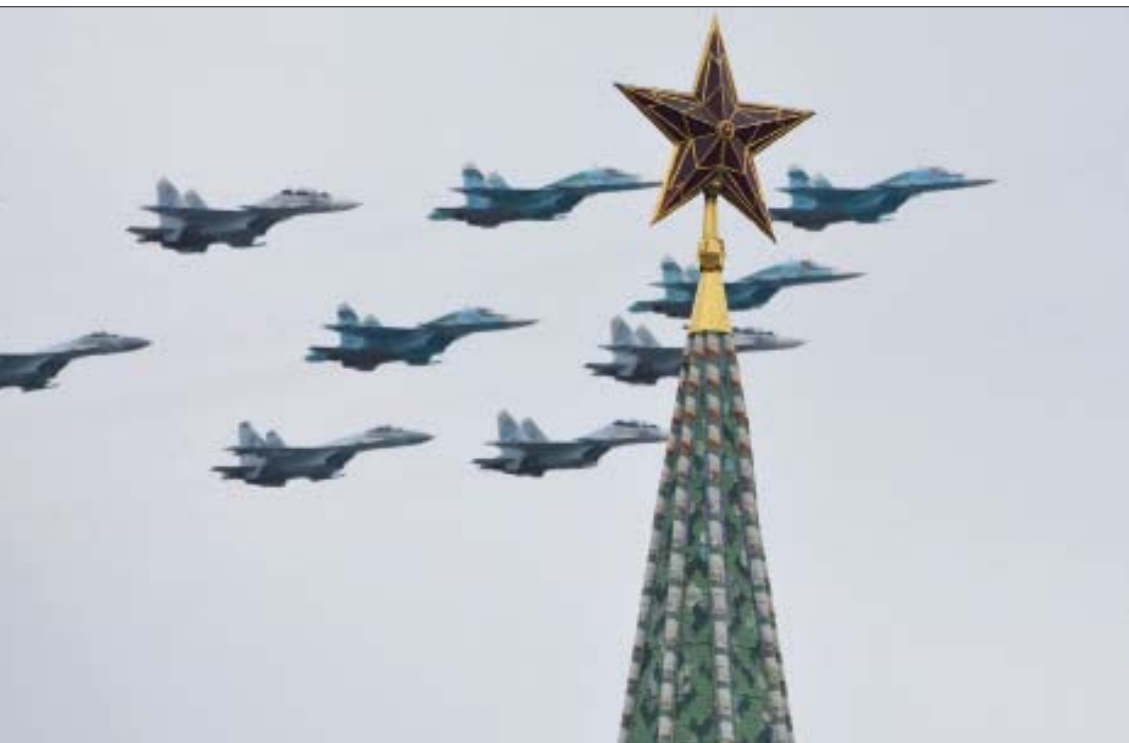
تشكيلات في سماء موسكو تضمنت قاذفات ومقاتلات «سوخوي - 57» من الجيل الخامس التي تعتبر الأحدث في سلاح الجو

كان الكرملين أعلن أن العرض العسكري التقليدي قد يقام في سبتمبر (أيلول) المقبل في حال انتصار اللوواء، لمتزامناً مع ذكرى نهاية الحرب العالمية الثانية بتوقيع اليابان صك الاستسلام في الثالث من سبتمبر 1945. وحضر بوتين بعد ذلك، استعراضاً محدوداً للدوريات حرس مشاة وخيالة للفوج الرئاسي في الكرملين، وقال في كلمة مقتضبة القاها أمام الجنود الفوج الرئاسي إن «مآثرة التعاون في حل القضايا الدولية الملحة». وهنا التزم الكرملين الشمالي بيمين جونغ أون، الرئيس بوتين، بمناسبة انتصار الحلفاء في الحرب العالمية الثانية. وقال في رسالته لبوتين «أتمنى يصدق أن ينجح الرئيس والشعب الروسي في تحقيق النصر المؤكد في كفاحهم لبناء روسيا القوية ومواصلة تقليد النصر الكبير في الحرب، ولمنع انتشار عدوى فيروس كورونا المستجد».