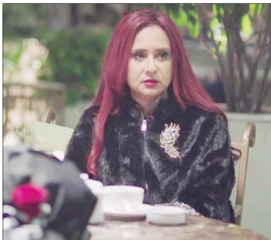
نيللي كريم في دور كوميدي بالمسلسل

و«الإفيها» الدارجة في عدد من مسلسلات رمضان هذا العام، ورغم كون المسلسل يكرر نوعاً ما فكرة المسلسل الإسباني الشهير «لاكاسا دي بايل» الذي عرضت منه عدة مواسم على «نتفليكس»، فإن خفة الطلحة المصرية تطفئ على «ب100 وش» وتعليقه نكهة أخرى مغايرة. وقد تفاعل معه الجمهور، واطلقوا عليه «لاكاسا دي بولاك»، باعتبار أن «سكير» بظلة العصابة من بولاق الدكتور. وتضعنا إشارة المسلسل، أغنية «مليونير» لفريق أغاني المهرجانات «المدفعية»، في حالة تأهب للمغامرات والنصب والإحتيال المضحكة، مع غناء نيللي كريم وأسرياسين، كل وفقاً لسمات شخصيته بالمسلسل «الشعبي» و«السرابي»، إذ إن تلاقح «سكير» ذات الثقافة الشعبية التي تعيش ببولاق مع «عمر» المنحدر من أسرة أرسقراطية تقطن الزمالك يفجر المرصاة (دينا ماهر) التي تترعد، لتسطو العصابة على حسابه