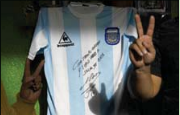
صورة تذكارية للقميص المعروض في مزاد خيري (أ.ف.ب)

يتصور الخدمة التي قدمها لنا إنها لا يقدر بثمن. وسأكون له ممتنة طيلة حياتي». ومنذ بداية الحجر قبل 50 يوماً للحد من انتشار «كوفيد - 19» تفاقم الفقر الذي كان يطال في الأساس 35,5 في المائة من الأرجنتينيين نهاية عام 2019، على ما قال وزير التنمية الاجتماعية دنيل أرويو.