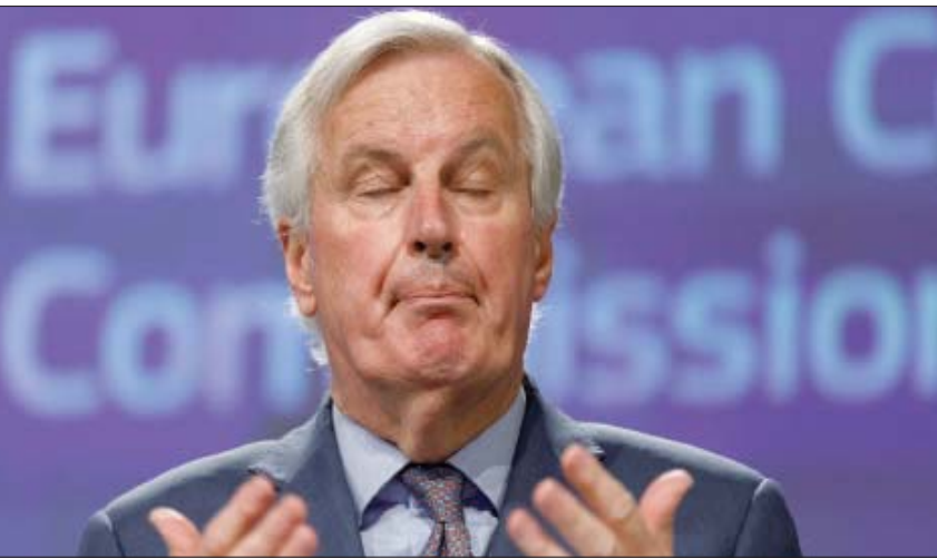
ميشال بارنييه المتشائل

«تمثيل كوفيد-19 التدايعات المرتبطة بـ«بريكست»». ووفق مصدر دبلوماسي نقلت عنه «وكالة الصحافة الفرنسية»، قال ميشال بارنييه للدول الأعضاء إن المملكة المتحدة غير مستعدة لتحقيق تقدم إلا «في المجالات التي لها فيها مصلحة، على غرار النقل والخدمات وتجارة السلع».