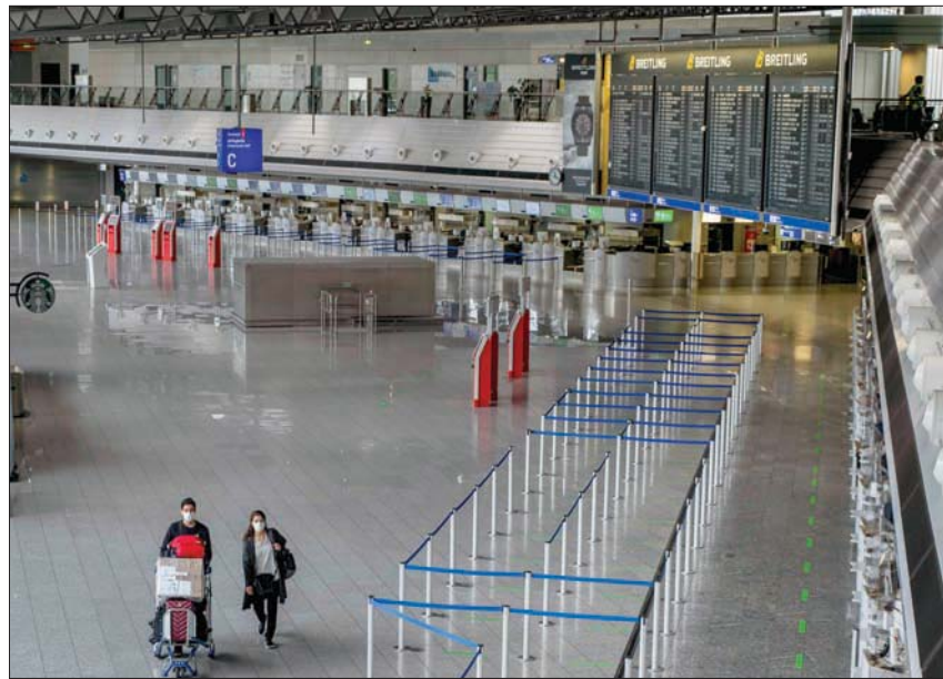
ضربت الحرب التجارية الاقتصاد العالمي بعد ضربة «بريكست» ليلحق بهما «كورونا»

وقال ماس في تصريحات لصحيفة «أوجسبورجر الجمانية» الألمانية الصادرة أمس السبت: «إنه أمر مثير للقلق أن تواصل بريطانيا الابتعاد عن بياننا السياسي المنفرد عليه في نقاط محورية بالغاوضات... هذا لا يجوز، لأن المفاوضات حزمة كاملة،