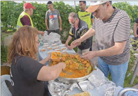
مطعمون تونسيون يوزعون وجبات إفطار مجانية في ريانة أول من أمس

بالضاحبة الشمالية لتونس: «الإعانة التي أتسلها تمكنني خصوصاً في شهر رمضان من تخفيف الأزمة».