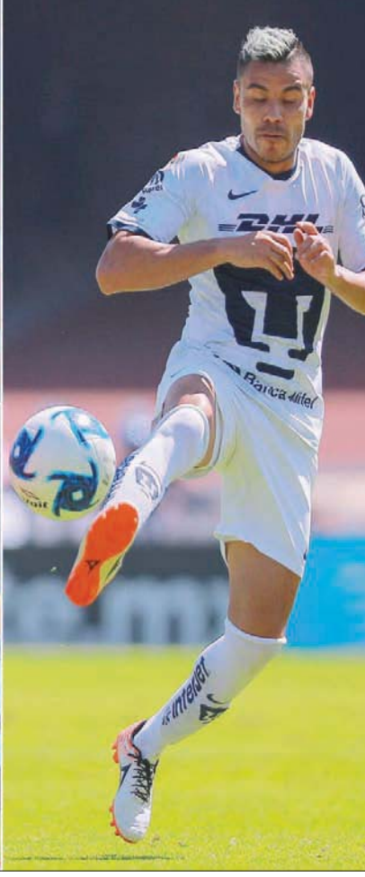
لويس ألبرتو - بابلو باريرا - ألكسندر سورلوث - جويل روبليس