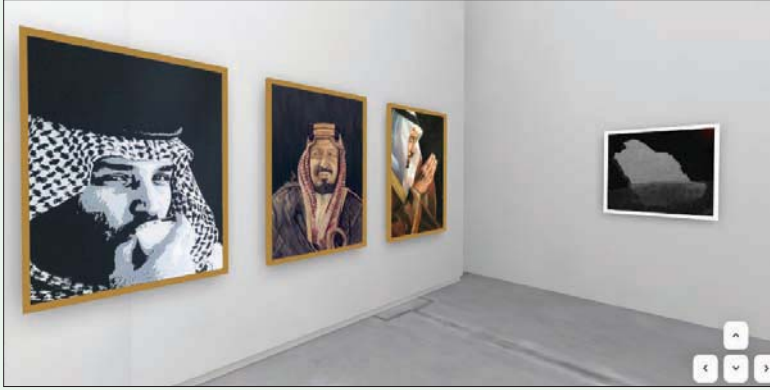
صور من المعرض الافتراضي «عزلة الاحتراف»