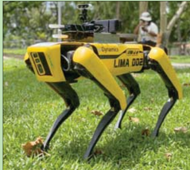
ابتعدوا عن بعضكم بعضاً لمسافة متر واحد على الأقل. أشكركم». ورغم هذا اللطف فإن انتهاك قواعد العزل العام المشددة في سنغافورة سجلت ما يربو على 21

سنغافورة، «الشرق الأوسط» بدلاً من إزعاج المارة بالنباح يطلب الكلب «سبوت» بصوت ناعم من راكبي الدراجات وممارسي رياضة الركض الحفاظ على مسافة بينهم. إنه كلب آلي يدات تستخدمه السلطات في سنغافورة للمساعدة في الحد من حالات العدوى بفيروس كورونا. ويعمل الكلب الآلي بالتحكم عن بعد وله أربعة أرجل وهو من تصميم شركة بوسطن ديناميكس. وبدأ عمله في متنته بوسط المدينة الخميس في إطار تجربة لاسبوعين قد تشهد انضمام روبوتات أخرى لحرارة المساحات الخضراء في المدينة خلال حالة العزل العام. وأثناء تجوله في المتنته، قال سبوت بالإنجليزية: «دعونا نبقى سنغافورة مكاناً صحياً، من أجل سلامتكم وسلامة من حولكم، رجاء