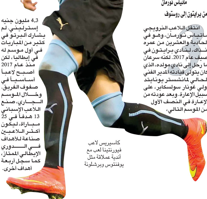
كاسيريس لاعب فيورنتينا لعب مع أندية عملاقة مثل يوفنتوس وبرشلونة