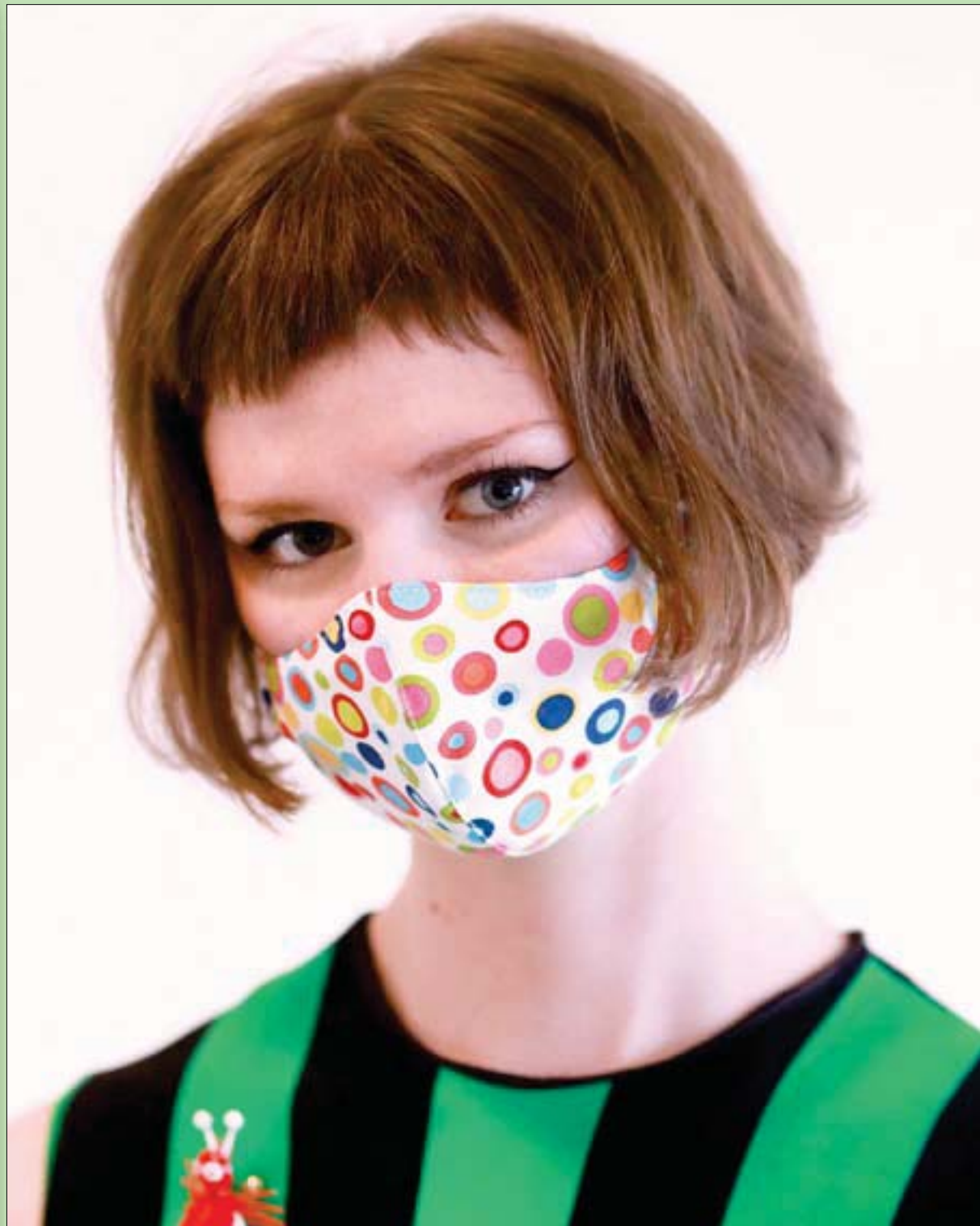
أمريكية في صورة تذكارية عقب الانتهاء من تصفيف شعرها بعد إعادة فتح صالونات التجميل في ولاية تكساس