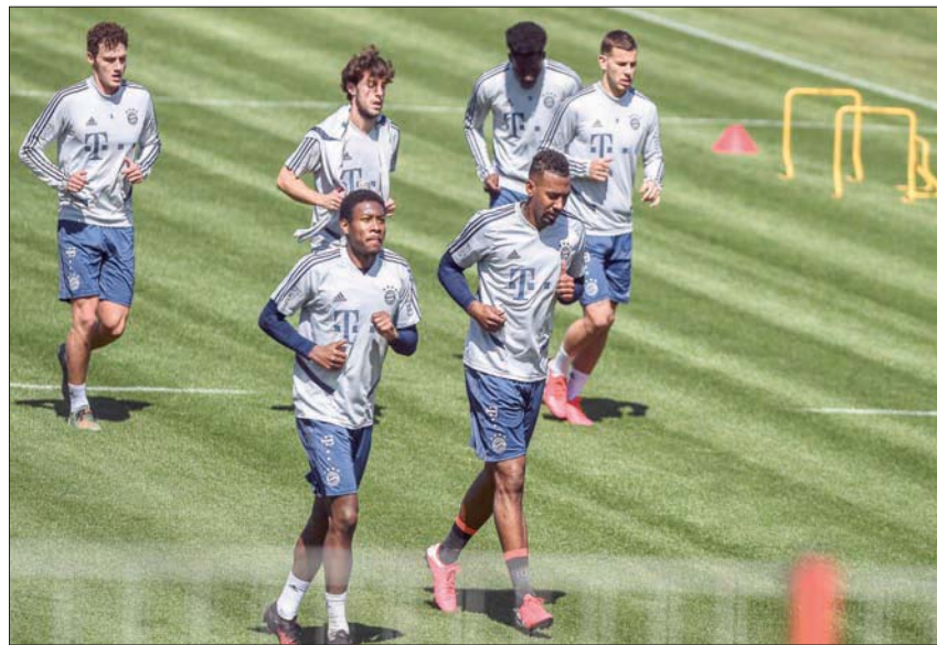
لاعبو بايرن ميونخ يستعدون لاستئناف الموسم الكروي

نجاح تجربة الدوري الألماني في استئناف منافساته بعد توقف نحو شهرين بسبب فيروس كورونا المستجد، سيعد في جانب منه إلى الحظ. وستصبح ألمانيا أول بطولة وطنية كبرى في اللعبة، تستأنف منافسات موسم 2019 - 2020. وذلك بدءاً من 16 الشهر الجاري، بعدما نالت رابطة الدوري ضوءاً أخضر لذلك من السلطات السياسية. وستقام المباريات من دون جمهور، على أن تعتمد الأندية بروتوكولاً صحياً صارماً للوقاية من «كوفيد - 19». وستكون التجربة الألمانية محط ترقب العديد من البطولات الأخرى، لا سيما إسبانيا وإنجلترا وإيطاليا التي تامل في استكمال الموسم، لكنها لم تحدد خريطة طريق عملية وزمنية واضحة لذلك بعد، في حين أن فرنسا كانت الأولى بين البطولات الكبرى التي تضع حداً للموسم وتعلن تنويع باريس سان جيرمان باللعب. ومع بدء العد العكسي لعودة الكرة