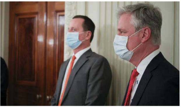
مدير المخابرات الوطنية ومستشار الأمن القومي بالبيت الأبيض خلال اللقاء