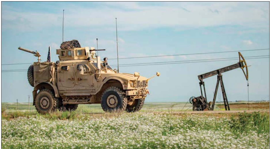
عربة عسكرية أميركية قرب منشأة نفطية سورية شرق نهر الفرات

حقل الريمان بريف الحسكة الشمالي الشرقي». وكان الرئيس الأميركي دونالد ترمب قرر في أكتوبر (تشرين الأول) الماضي سحب قواته من شمال شرقي سوريا، ثم عاد ووافق على الإبقاء على حوالي ألف عنصر لحماية حقول النفط. وحسب مصادر عدة، تحتفظ أميركا بما لا يقل عن 11 قاعدة عسكرية في محافظة الحسكة والرقعة ودير الزور خصوصاً قرب منشآت النفط والغاز في محاذة حدود العراق، إضافة إلى قاعدة التنف على الحدود السورية - العراقية - الأردنية.