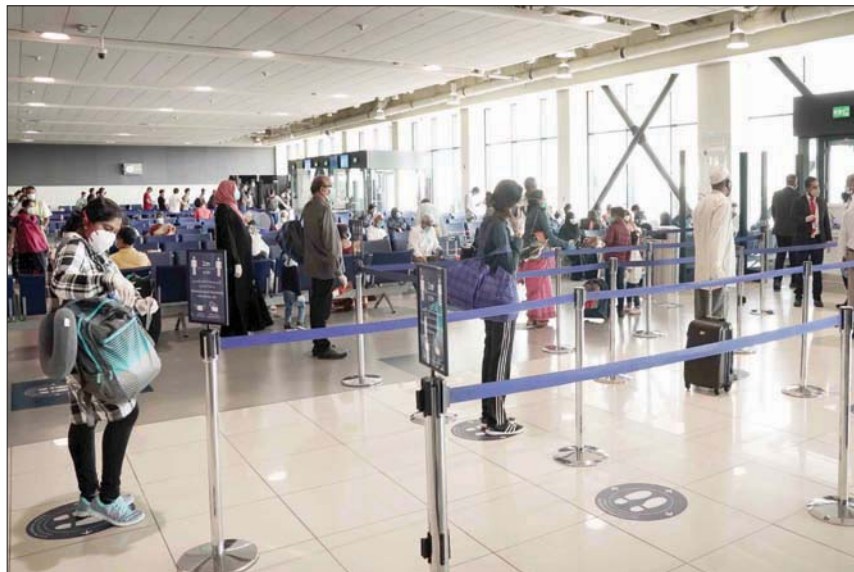
تعمل المطارات العالمية على تطوير أنظمة للتعامل مع حركة المسافرين تضمن عدم انتشار فيروس كورونا

المياه على مدار الساعة، بينما تم تركيب حواجز لقياس حرارة القادمين إلى المطار من مسافرين وعاملين في مطار سنغافورة وبعض مطارات الخليج. وتشير هذه الإجراءات التي بدأت مطارات أوروبية في تطبيقها إلى أنها سوف تكون الأولى في التشغيل بالنظم الجديدة عند انتهاء الحجر على الطيران. وقد تبدأ الرحلات أولاً بين المطارات المعدة لاستقبال الركاب بصلاحة مع تطبيق الإجراءات الصحية. وعلى هذا المقياس، سوف تكون المطارات الأميركية هي الأخيرة التي تلحق بهذا الركب، حيث تركز إدارة أمن المواصلات الأميركية التي يشار إليها بحروف (TSA) على إجراءات الأمن فقط منذ عام 2015، بتركيب أجهزة