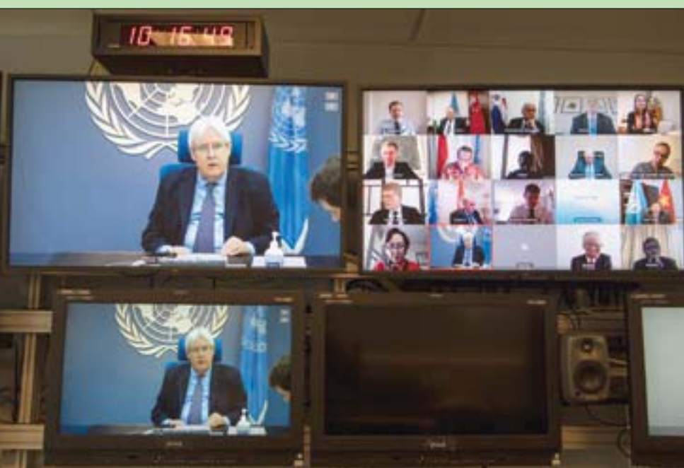
جانب من إحاطة للمبعوث الأممي إلى اليمن لمجلس الأمن في جلسة افتراضية

وثق مركز حقوق في 110 حالات لانتهاك طالت مدنيين في محافظة تعز خلال شهر أبريل (نيسان) الماضي، عدت من الأطراف في مختلف مديريات المحافظة. «ميليشيا الحوثي تسببت بمقتل 22 مدنياً، قتل 7 نساء وطفلان خلال قصف ميليشيا الحوثي على الأحياء السكنية بالقذائف المختلفة، مرتكبة خلالها مجزرة دموية راح ضحيتها 6 نساء وطفلتان وأصبحت 7 نساء و5 طفلات ورجل واحد، كما قتل 5 مدنيين برصاص مباشر من قبل ميليشيا الحوثي، فيما قتل قنصل تابع للميليشيا 3 مدنيين بينهم امرأة وطفل، وقتل عامل في نزع الألغام جراء انفجار لغر زرعت ميليشيات الحوثي، كما أعدت ميليشيا الحوثي مدنيين اثنين وتوفي طيل جراء التعذيب من قبل الميليشيات، وارتكب أفراد في ميليشيا الحوثي مجزرة أخرى حيث