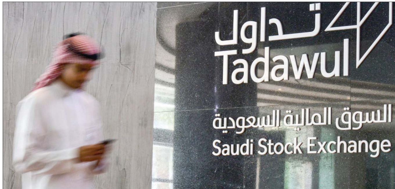
سوق الأسهم السعودية تتفاعل مع عودة تعافي أسعار النفط ومكاسب الأسواق المالية العالمية (الشرق الأوسط)

للاسهم السعودية مع ختام تعاملات الأسبوع المنصرم عند مستويات 7,76 تريليون ريال (2,069 تريليون دولار)، فيما من المتوقع أن تبدأ كثير من الشركات بالإعلان عن نتائجها المالية للربع الأول من هذا العام، بشكل أكبر خلال تعاملات هذا الأسبوع، يأتي ذلك بالمقارنة مع عدد الشركات المعلقة عن نتائجها المالية في الأسبوع المنصرم، والتي بلغ عددها 17 شركة.