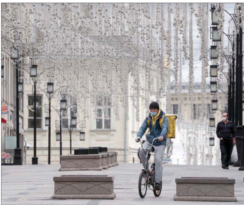
موظف يوصل طعاماً لأحد الزبائن في موسكو أمس

هذه المعطيات، ونقلت عن نائب مدير المختبر الدولي لبحوث السكان والصحة سيرغي تيمونين أنه «إذا مات شخص مصاب (بكوفيد - 19) بنوبة قلبية، فإن السبب الرسمي للوفاة سيكون النوبة القلبية»، وأضاف: «بكلمات أخرى، لن يتم إدراج جميع حالات وفاة حاملي الفيروس في قائمة الوفيات الناجمة عن الفيروس».