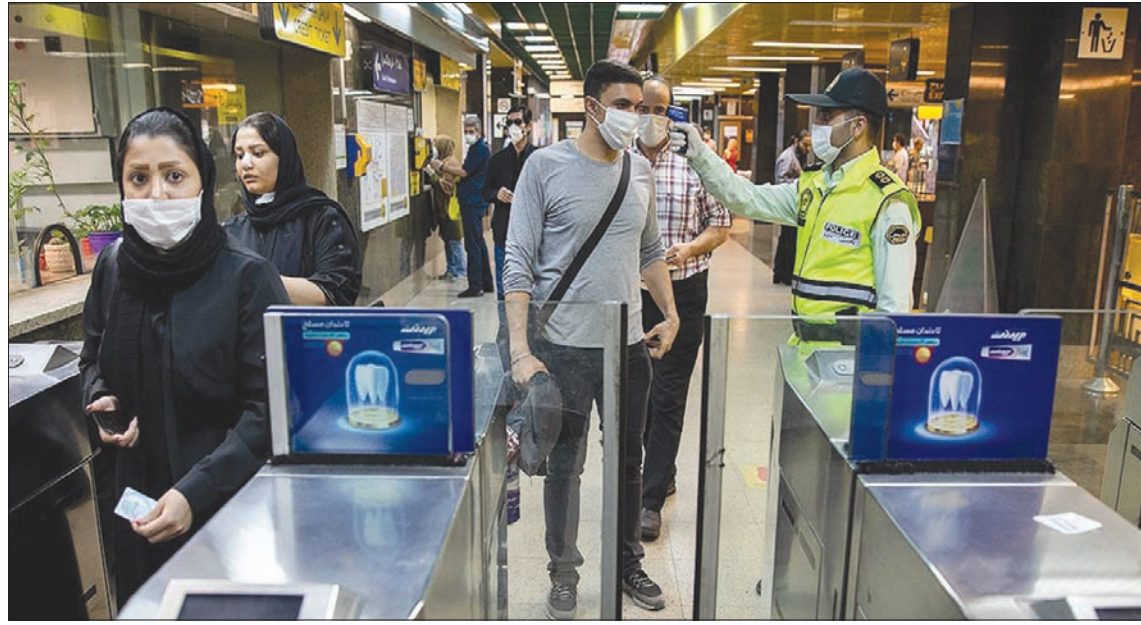
شرطي يقيس حرارة الركاب في محطة صادقية لمترو الأنفاق غرب طهران أمس

تلنن - طهران، الشرق الأوسط وقالت الوزارة أول من أمس إن مسار تطور حالات العدوى بدأ يتخذ اتجاهاً نزولياً «تدرجياً» في إيران. ونكرت الوزارة أمس أن إجمالي عدد الوفيات الناجمة عن الفيروس ارتفع إلى 6203 بعد مشاهدة «يوم القدس» بسبب جائحة كورونا.