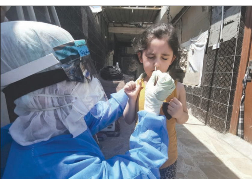
عاملة صحة تخضع طفلة لفحص «كورونا» في النجف الثلاثاء الماضي

وقالت إن - ماري تريفلينان وزيرة التنمية الدولية، في حديث للبرلمان إن «جائحة كورونا تظهر لنا الآن، وأكثر من أي وقت مضى، الدور الحيوي الذي تلعبه اللقاحات في حمايتنا جميعاً. وإننا بما نقدمه من دعم لتحالف غافي، نساعد في وقف انتشار الأمراض المعدية، وإنقاذ ملايين الأرواح والحفاظ على بريطانيا آمنة». فيما وصفت روزي ديباز، المندوبة باسم الحكومة البريطانية في الشرق الأوسط وشمال أفريقيا، دعم بريطانيا لتحالف غافي بالحيوي، قائلة إنه سيساهم بشكل كبير في