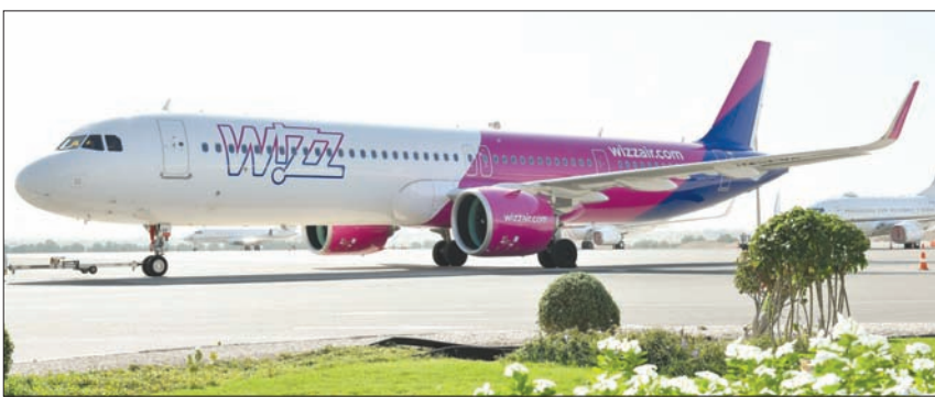
«ويز إير» أول شركة طيران أوروبية منخفضة التكلفة تشغل عملياتها من أبوظبي

شركة (ويز إير) مع الاستراتيجية التي تتبناها أبوظبي لتنوع اقتصادها، حيث إننا سنواصل جهودنا لتحفيز حركة الطيران، وزيادة الطلب على الرحلات، بما يدعم نهج أبوظبي لتنوع مواردها السياحية والاقتصادية. كما نتطلع لاستقطاب مزيد من المسافرين عبر أسطول طائراتنا، مع مراعاة ضمان سلامة ورفاهية الطواقم والمسافرين». وتعد أبوظبي الوجهة الجديدة لشركة «ويز إير» التي ستستقطب المسافرين من 5 مدن رئيسية في 4 دول كبرى وسط وشرق أوروبا، لتضيف بذلك ما يقارب 220 ألف مقعد سنوياً لشبكة الطيران التي تربط بين أبوظبي ومختلف دول العالم، فيما أشارت الشركة إلى أن عدد المسافرين من أبوظبي إلى بودابست سيبلغ 59,99 يورو (65,8 دولار).