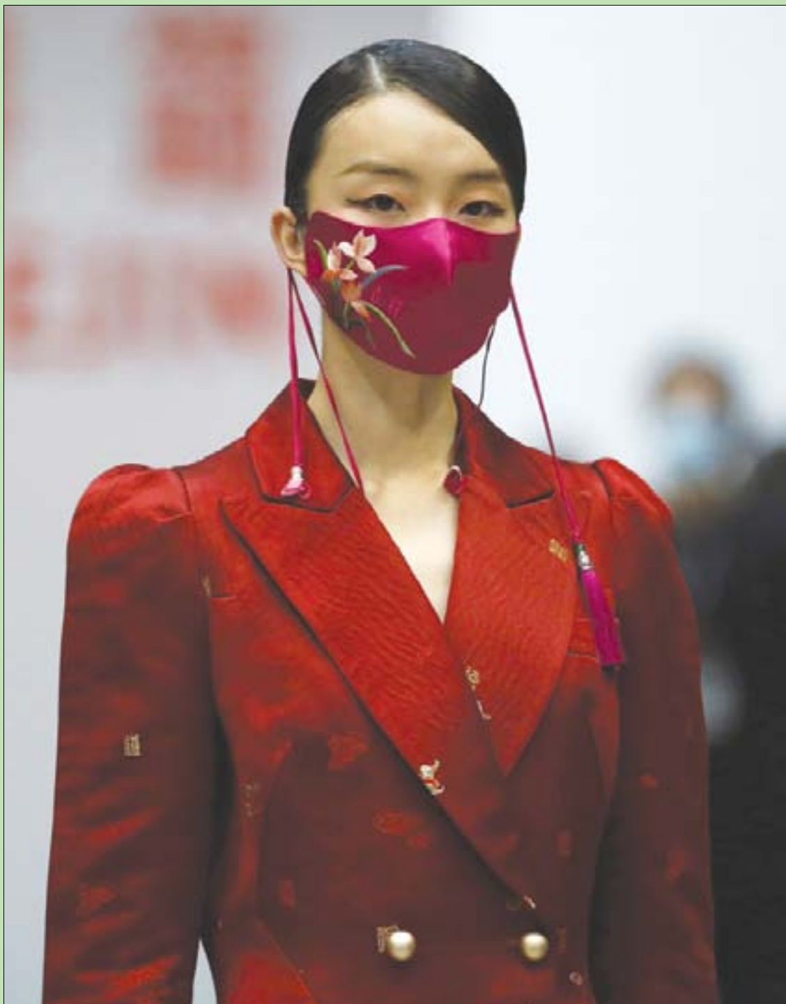
عارضة أزياء ترتدي كمامة خلال أسبوع الموضة الصيني في بكين أمس