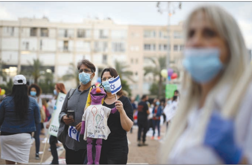
من مظاهرة الأسبوع الماضي رفضاً لقرار حكومة تل أبيب بإعادة افتتاح المدارس الابتدائية

كما ترى وزارة المالية أن هذه الإحصائيات تؤكد أن إسرائيل سيطرت على انتشار الفيروس وبدأت الانحسار المعاكس، وحين الوقت لوضع خطة مفصلة لإعادة الحياة إلى طبيعتها. وتتخالف خطة الوزارة من أربع مراحل. تبدأ يوم غد الثلاثاء بفتح المجمعات التجارية التي تعمل تحت سقف واحد (المجمعات المفتوحة تعمل منذ أسبوع)، وعودة العمال الفلسطينيين إلى الداخل، وعودة الدراسة في الجامعات، بموجب خطة مجلس التعليم العالي، والسماح