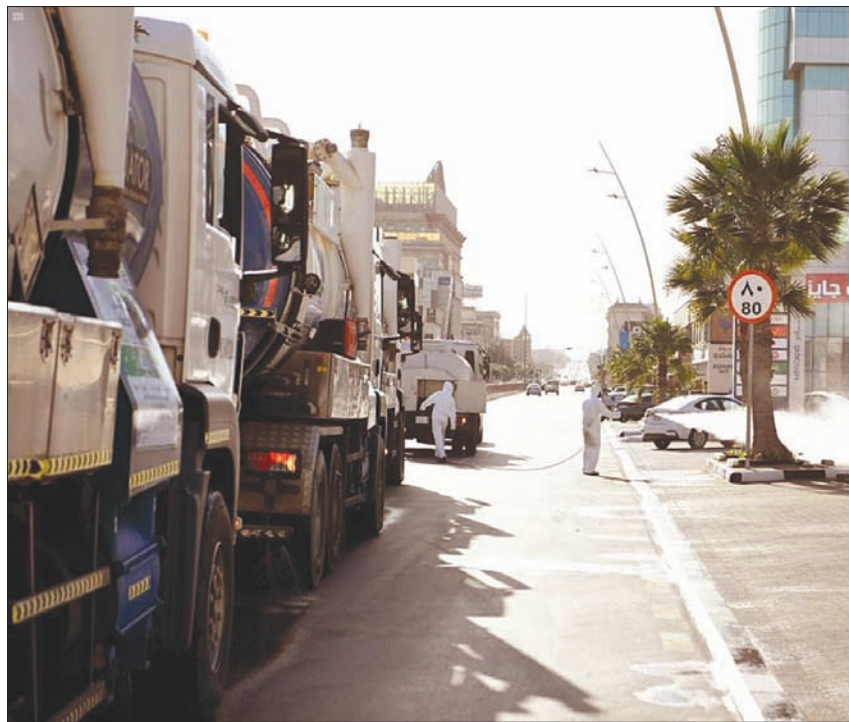
أمانة المنطقة الشرقية في السعودية تواصل تعقيم مدنها (واس)

كشف مسؤول حكومي أن مختبرين سعوديين يجريان أبحاثاً على اللقاحات المحتملة لفيروس كورونا (كوفيد-19) الذي أصاب أكثر من 25 ألفاً في البلاد حتى الآن، لافتاً إلى أن 7 مستشفيات سعودية تجري اختبارات على أدوية فيروسية لعلاج مصابي «كورونا». وأوضح الدكتور عبد الله عسيري، استشاري الأمراض المعدية والوكيل المساعد للصحة الوقائية بوزارة الصحة، خلال مؤتمر صحفي في الرياض أمس، أن الدراسة السريرية التي جرى الإعلان عن بدايتها أول من أمس في السعودية تهدف إلى اختبار عدد من البروتوكولات العلاجية التي ثبتت فعاليتها في الاختبارات الأولية، سواء في المختبرات أو في دراسات سابقة على متطوعين.