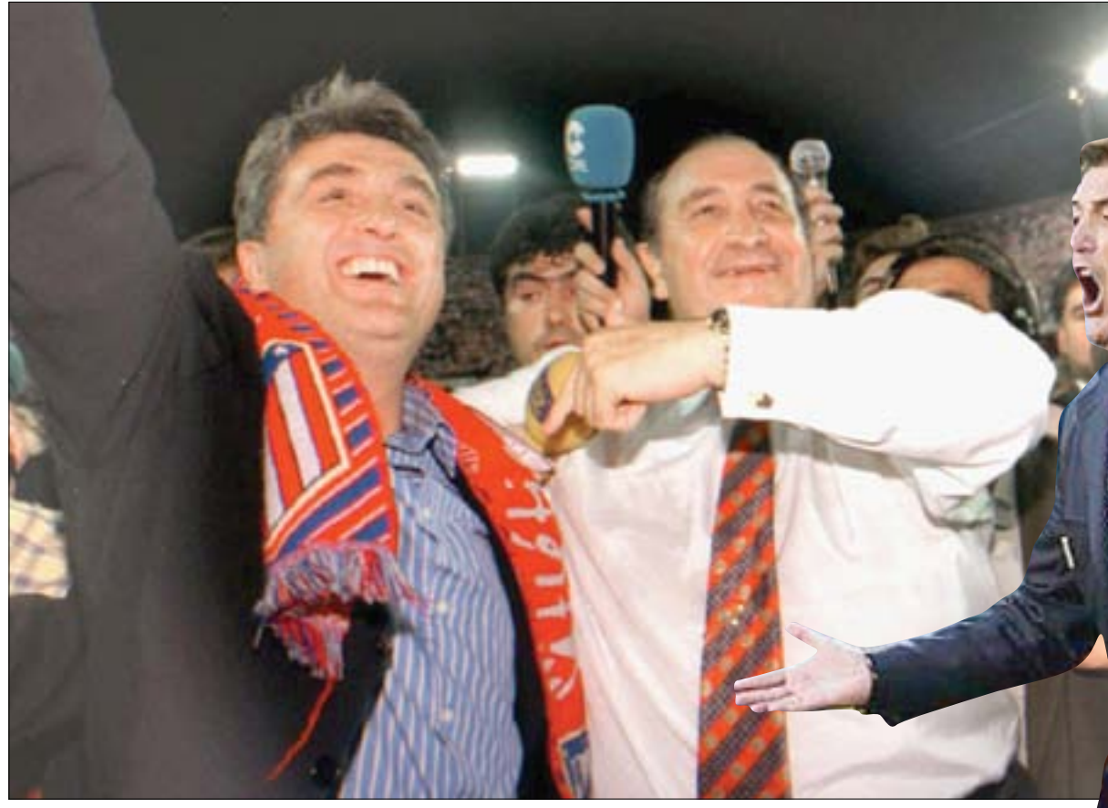
أنتيتش (يسار) ورئيس أتلتيكو جيل يحتفلان بحصد النادي لقب الدوري الإسباني عام 1996

وبالتعاقد مع مواطنه ميلينكو بانتيتش، لكن بعد أن وعد رئيس النادي، خيسوس جيل، بأنه سيدفع نصف راتبه إذا فشلت هذه الصفقة. بيد أن هذه الصفقة حققت نجاحاً كبيراً، وحتى الآن يتم وضع الزهور في زاوية معينة داخل النادي تكريماً لما حققه الفريق في ذلك الوقت، وحصوله على لقب الدوري الإسباني الممتاز، حيث أنهى أتلتيكو مدريد 19 عاماً من دون الحصول على لقب الدوري، ونجح أنتيتش في قيادة النادي في عام 1996 للحصول على الفئضية المحلية، لأول مرة في تاريخ النادي. ووصف بانتيتش أنتيتش بأنه «والده»، وهو الأمر الذي كان يشعر به كثيرون من عشاق النادي. في الحقيقة، من المستحيل أن نصف حجم الإنجاز الذي حققه الفريق في ذلك الموسم، أو كيف كان هذا الإنجاز غير متوقع على الإطلاق. وفي السنوات الثماني التي سبقت وصول أنتيتش، تولى قيادة أتلتيكو مدريد 30 مديراً فنياً مختلفاً، لكن أنتيتش استمر في قيادة الفريق ثلاث سنوات، وخرج خلالها من دوري أبطال أوروبا في عام 1997 بشكل سيئ الحظ لم يستطع تحمله، قبل أن يرحل في نهاية المطاف في عام 1998. وعاد المدير الفني الصربي لتولي قيادة أتلتيكو مدريد في ولايتين منفصلتين، في عام 1999 ثم في عام 2000، لكنه لم يحقق الإنجاز نفسه الذي حققه في عام 1996. ولا توجد أي تجربة أخرى تقارن بتجربته مع أتلتيكو مدريد، ربما باستثناء الفترة التي قضاها مع لوتون تاون. وقال أنتيتش عندما رحل عن أتلتيكو مدريد للمرة الأولى: «أنا أتي من الداخل»، وفي بداية الشهر الماضي، رحل المدير الفني الصربي إلى الأبد، وللمرة الأخيرة.