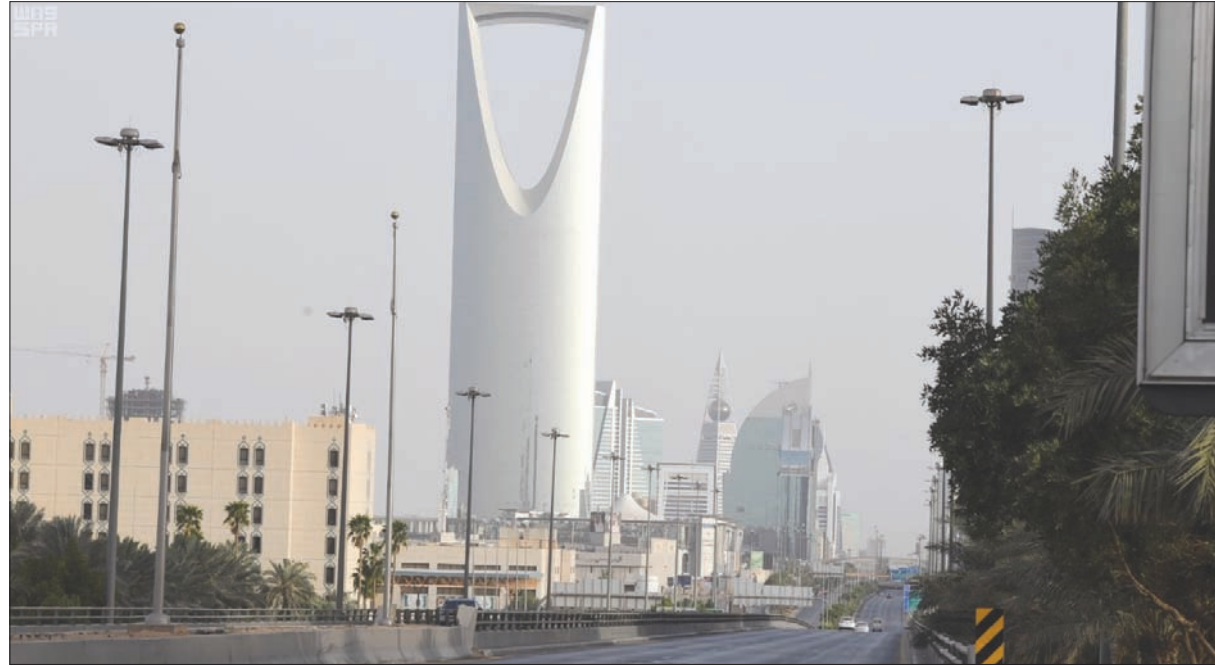
السعودية تدفع مزيد من مجابهة تداعيات «كورونا» بالتوجه نحو تقليص نفقات مالية الدولة (الشرق الأوسط)

يتم استخدامها لتغطية عجز الميزانية إذ تم الاستفادة من تريليون ريال خلال السنوات الخمس الماضية، مؤكداً في الوقت ذاته استخدام الحكومة جزءاً من إيرادات الاستثمارات الخارجية.