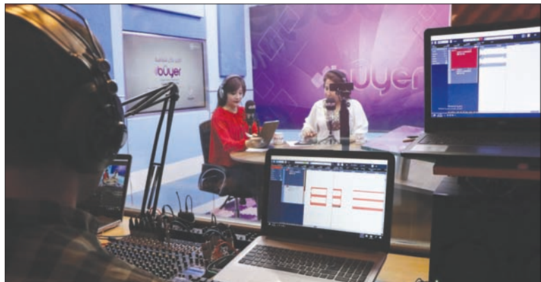
بث مباشر لأحد البرامج يتفاعل معه الجمهور عبر الاتصالات أو الرسائل النصية

ويعمل في مؤسسة بوير برس وتتعني بالعربية «الحدث» مجموعة إعلاميين من ذوي الخبرة أختاروا الزور شرق البلاد، في محاولة لإرسال رسائل تحد وكسر لاحتكار الحكومة السورية لوسائل الإعلام الرسمية والبصرية. يقول برزاني فرمان مدير القسم الكردي في المؤسسة، إن المحتوى العربي يترجم بالكامل إلى الكردية على جميع منصات بوير برس وأعرب أنها «مهمة شاقّة نظراً لأن الكثير من المصطلحات جديدة يتلقاها المستمع، لذلك نبحث عن