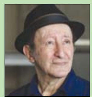
باريس: «الشرق الأوسط»