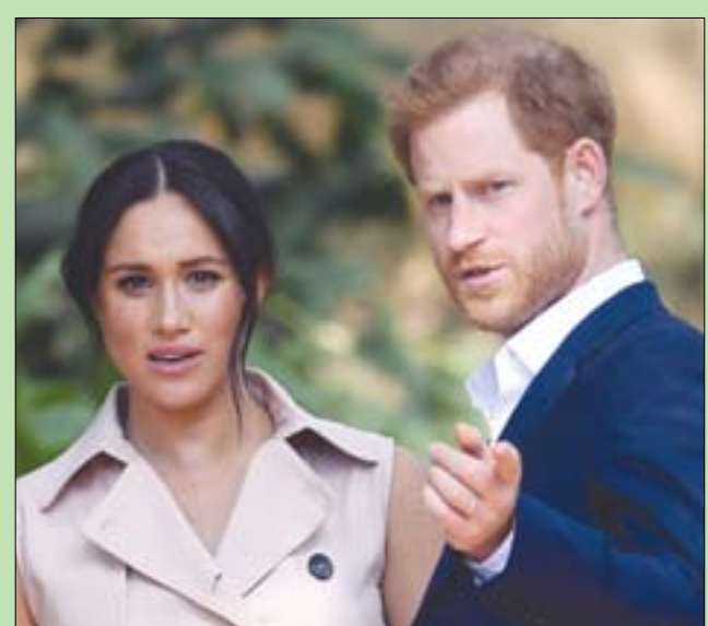
الأمير هاري وقرينته ميغان

زوجته ميغان ماركل قد اختارا بالفعل قصرًا كبيراً تبلغ قيمته 10 ملايين جنيه إسترليني والذي ربما يكون أيضاً بمثابة منزل للسيدة دوريا والدة الدوقة. وأفادت التقارير بأن الزوجين المكين يفكران ملياً في شراء المنزل الفسيح الذي يتكون من ست غرف للنوم، ويقع بالقرب من حي «باسيفيك باليسيدس» الراقى في مدينة لوس أنجلوس. ويمكن رؤية المنزل من خلال جولة افتراضية بتقنية 360 درجة، ويوجد فيه مطبخ أبيض اللون واسع للغاية، مع منطقة مسبح كبيرة، وعرفة لعرض الأفلام السينمائية. ويعرض السيد ستيف تشاسمان، منتج سلسلة أفلام «فاست أند فيوريوس»،