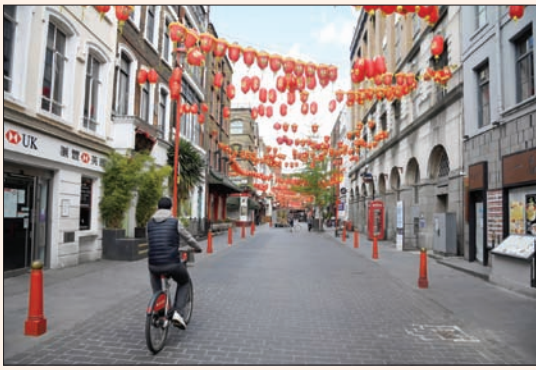
الحي الصيني في لندن بدأ خالياً أمس

يُستخلص من تطورات الأيام الأخيرة في المشهد السياسي الدولي، الذي تولّد من جائحة «كوفيد - 19»، أن التصنع الذي بدأت ملامحه تظهر على العلاقات بين الاتحاد الأوروبي والصين بات يهدّد التفاهم الودي الذي يحرص الطرفان على ترسيخه منذ سنوات.