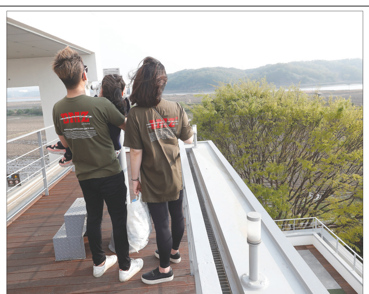
عائلة كورية جنوبية في منطقة باجو الحدودية تنظر أمس باتجاه الشمال حيث بدأ إطلاق النار

ولاستبدال طائرات «تورنايدو»، طلبت وزيرة الدفاع الألمانية انغريت كرامب كارنباور أخيراً شراء 93 مقاتلة أوروبية من طراز «يوروفايتر». إضافة إلى 45 مقاتلة «إف18» أميركية تكلف مواصلة نقل القنابل النووية الأمريكية، لأن طائرات «يوروفايتر»، لا تستطيع القيام بهذه المهمة. ويبدو واضحاً أن المقاتلات الأمريكية هي محور الجدل. ويخبر موقف الاشتراكيين الديموقراطيين استياء المحافظين الذين يرون أنه غير واقعي. وفي هذا السياق، قال أحد النواب المحافظين، باتريك سنسبورغ، لصحيفة «هانديسلات» إن «الحزب الاشتراكي الديمقراطي» يتعامل بتوتر شديد مع قضية السياسة الأمنية، (ويجس) أن الأسلحة النووية الأمريكية تستخدم بالدرجة الأولى لحماية».