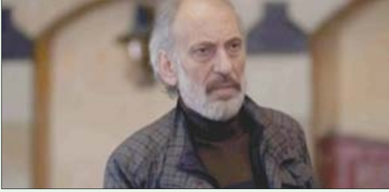
غسان مسعود بطل حلقات «مقابلة مع السيد آدم»

يُعمل في حراسة سجن النساء نهاراً ويبيع ما يسرقه السوري من هواتف ليلاً (الجيد طلال الجريدي)، وهو لا يفعل ذلك مضطراً لأنه متزوج مثلاً ولديه أسرة لا يكفي مدخوله الرسمي لإعالتها، بل لأنه شيرير النوايا في الأصل. كل هذه الشخصيات وسواها تستمر معنا بوتيرة حثيثة وبإخراج جيد للمشاهد ومحتواً. بعض الحلقات ذات تصوير باهت لكن معظمها جيد. التمثيل من الجميع يتراوح من المتوسط وما فوق، وما فوق هو الغالب. لكن المعضلات تكمن في الحكاية التي تُثير الإعجاب. في هذا الخليط ما بين مشاكل وتبعات مشاكل كل شخصية من القاضية التي لا تنجب والتي ترزح تحت وطأة عملها (كما نعلم عنها أكثر في الحلقتين السادسة والسابعة) إلى مقدم البرامج الذي يطلع على خصوصيات الناس لاستغلالهم في برنامجه الناجح، في هذا الخليط هناك ما لا يمكن الموافقة عليه وبينها ما هو صادم.