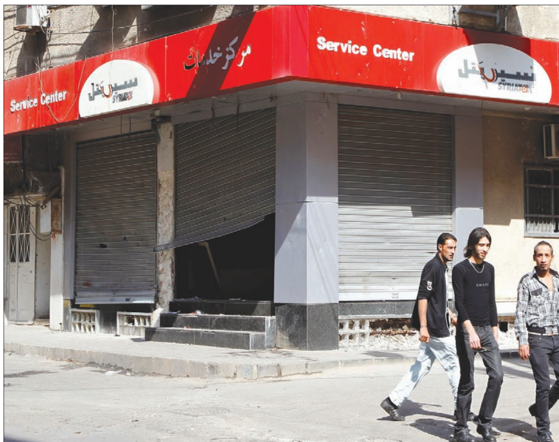
فرع شبكة «سيرياتل» في درعا وقد أقتل بعد اندلاع الاحتجاجات في مارس 2011

دمشق: «الشرق الأوسط» في تصعيد سريع، حذّر رجل الأعمال رامي مخلوف، ابن خال الرئيس بشار الأسد من مغبة التجاوزات والتهديدات التي يتعرض لها من قبل الأجهزة الأمنية، وقال في ظهور ثانٍ له خلال أقل من يومين، عبر تسجيل مصور نشره على حسابه في «فيسبوك» ومدته 10 دقائق، إنه تلقى تهديدات «إما أن تتنازل وإما أن نسجن كل جماعتك»، محذراً من «أيام صعبة».