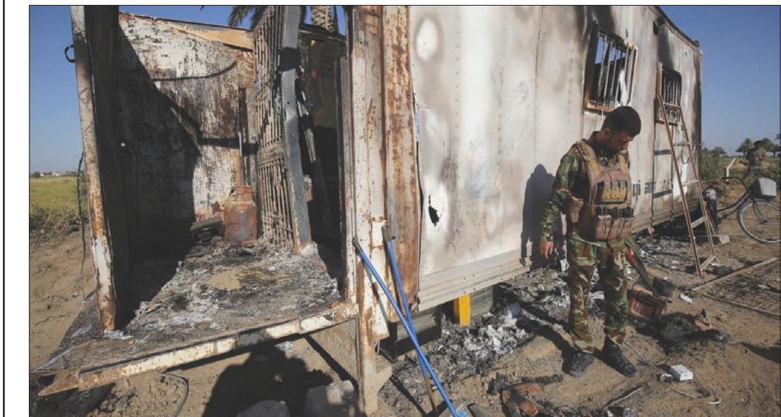
آثار هجوم شنه «داعش» على إحدى نقاط الحشد الشعبي» في مكيشيفة جنوب تكريت فجر السبت

بغداد، «الشرق الأوسط» يصل إلى بغداد اليوم النواب العراقيون العالقون في بعض المحافظات وإقليم كردستان بسبب جائحة «كورونا» استعداداً لعقد الجلسة المقررة للتصويت على حكومة مصطفى الكاظمي. مخاوف النواب لا تنحصر فيما إذا كانت الحكومة ستمر كاملة أم منقوصة كسابقاتها بل في كيفية تفادي الاختلاط بينهم في ظل تعليمات التباعد الاجتماعي.