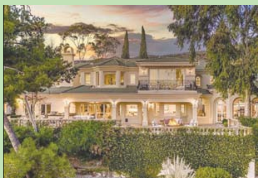
قصر ستيف تشاسمان منتج سلسلة أفلام «فاست أند فيوريوس»