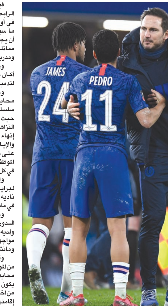
لامبارد مدرب تشيلسي طالب بإشراك اللاعبين في إبداء رأيهم لاستكمال الموسم (إ.ب.أ)

فيما قال الهولندي روب بانسن، رئيس الرابطة التي تمثل الكولاء والوسطاء في أوروبا (إي إف إي)، «ساقول لكم ما سيكون السؤال الأهم: هل يمكن لناد أن يجبر لاعبيه على اللعب في ظروف مماثلة؟ هل بإمكانك أن تضع فريقا كاملا ومدربيه وعامله في العزل في الفنادق؟». وتابع: «ستكون إصابة شخص واحد، أكان نادلا أو موظفا في الفندق كافية لتدمير البطولة مجددا». وتعتبر إقامة المباريات في ملاعب محايدة نقطة شائكة إضافية، عدا عن سلسلة من القضايا اللوجستية الأخرى، حيث لا تزال هناك معارضة على أسس النزاهة الرياضية حول عدم تطبيق فكرة إنهاء الموسم على قاعدة مباريات الذهاب والإياب. ويهدف اقتراح إقامة المباريات على ملاعب محايدة إلى تقليل عدد الموظفين الطبيين والأمنيين والإعلاميين في كل مباراة. وأعرب بول باربر الرئيس التنفيذي لبرايتون أند هوف البيون، عن رفض ناديه فكرة خوض بقية مباريات الموسم في ملاعب محايدة. ويحتل برايتون المركز 15 بين فرق الدوري الإنجليزي الممتاز العشرين، ولديه 5 مباريات على أرضه، وهي تتضمن مواجهات مع مانشستر يونايتد وليفربول ومانشستر سيتي وأرسنال. وقال باربر: «في هذه المرحلة الحرجة من الموسم، فإن خوض مباريات في ملاعب محايدة، من وجهة نظرنا، من الممكن أن يكون له تأثير على نزاهة المسابقة، خمس من آخر تسع مباريات متبقية لنا من المقرر إقامتها في ملعبنا، وجميعها مباريات صعبة للغاية، كما أن أربع منها ستكون في مواجهة بعض أكبر الفرق على المستوى الأوروبي».