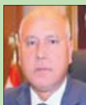
المهندس كامل الوزير