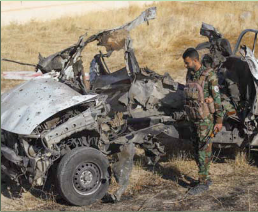
حطام عربة عسكرية في موقع لـ«الحشد الشعبي» شمال بغداد هاجمه «داعش» أول من أمس

كشفت مصادر مطلعة في مدينة الموصل، مركز محافظة نينوى في شمال العراق، أن «بعض التجار اشتكوا مؤخراً من قيام عناصر (داعش) مجدداً بفرض إتاوات عليهم»، الأمر الذي يعيد إلى الأذهان عمليات الإبتزاز وفرض الإتاوات التي كان يقوم بها التنظيم على تجار وأغنياء المدينة قبل احتلالها من قبل التنظيم الإرهابي في يونيو (حزيران) 2014. وقال مصدر، فضل عدم الإشارة إلى اسمه، لـ«الشرق الأوسط»، إن عمليات الإبتزاز والإتاوات الحالية «تجري سراً في معظم الأحيان، لكن بعض التجار يستجيبون لها خوشتهم من التعرض للانتقام».