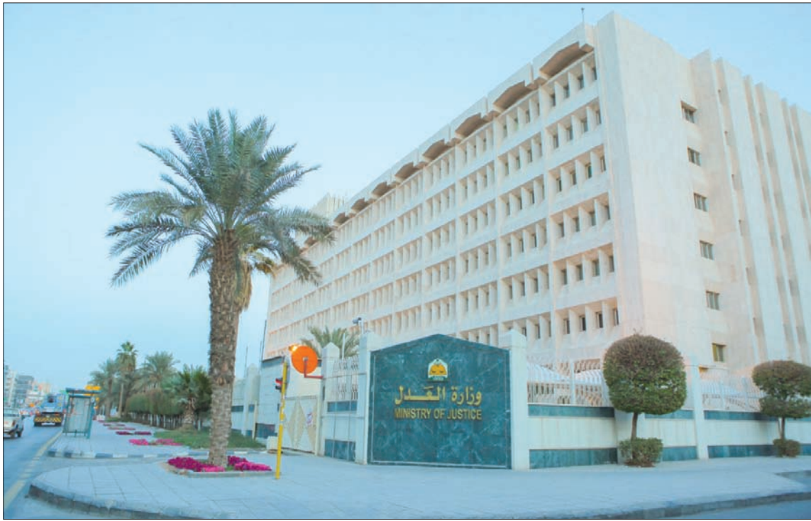
وزارة العدل السعودية تطلق منصة القطاع الخاص لأنشطة البيع والتصنيفية (الشرق الأوسط)

وفي تطور آخر، طالب مجلس الشورى السعودي، حول