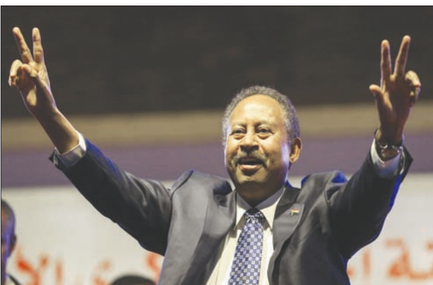
حمدي في لقاء جماهيري

بالمعايير المهنية والالتزام بها. يذكر أن الأمين العام للأمم المتحدة أنطونيو غوتيريش، أشار في رسالة بمناسبة «اليوم العالمي للصحافة» تحت عنوان «مزاولة الصحافة دون خوف أو محاباة»، إلى أن الصحفيين والعاملين في وسائل الإعلام يلعبون دوراً مهماً في مساعد الأمم المتحدة على اتخاذ القرارات المستنيرة، والتي قد تنقذ حياة الناس من الموت في الوقت الذي يخاف فيه العالم جائحة «كوفيد-19»، وحثّ غوتيريش الحكومات على ضمان سلامة الصحفيين في أداء عملهم طوال فترة تفشي الجائحة وما بعدها، قائلاً: «نناشد الحكومات أن تحمي العاملين في وسائل الإعلام، وتعزز حرية الصحافة وتحافظ عليها، فذلك أمر أساسي لمستقبل يسوده السلام وينبع فيه الجميع بالعدالة وحقوق الإنسان».