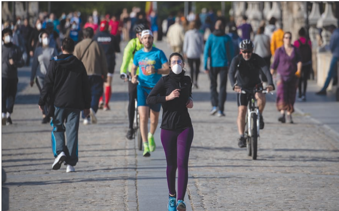
إسبان يمارسون الرياضة بعد تخفيف القيود في مدريد أمس

منفعة عامة عالمية فريدة في القرن الحادي والعشرين».