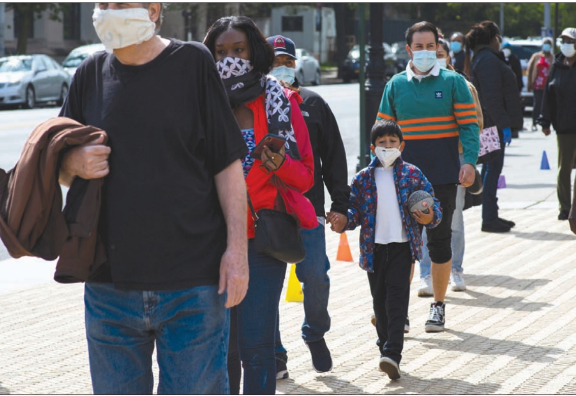
أشخاص ينتظرون الحصول على كامات مجانية في بروكلين أمس

وقال: «اعتقد أنه بإمكان العالم بأسره أن يرى الآن ويذكر أن لدى الصين تاريخا في نقل العدوى إلى العالم، وتشغيل مختبرات غير مستوفية للمعايير». ورأى أن المحاولات الصينية للتقليل من