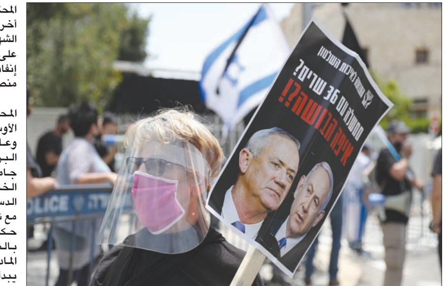
مظاهرات من اليمين واليسار أمام المحكمة العليا الإسرائيلية أمس

وسط ظروف غير مريحة بضغط من اليمين واليسار المحكمة العليا تنظر في صلاحية نتنيهاو لرئاسة الحكومة