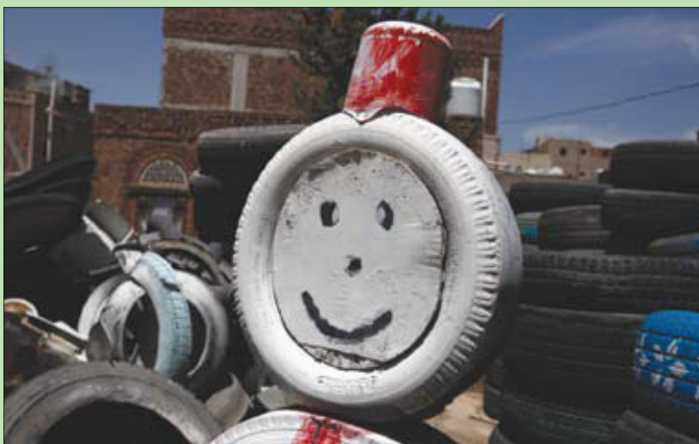
وجه باسيم وضع أمام متجر يعيد استخدام الإطارات التالفة في صنعاء

الذي طلب بأن يرمز لاسمه بـ«ن»، إنه تعرض بعد انقلاب الميليشيات لسلسلة من المضايقات من قبل مشرف الجماعة بالوزارة. وأوضح أن المشرف الحوثي دفعه للتحالز عن عمله وإحلال موظف آخر من أتباع الجماعة مكانه، وقال لـ «الشرق الأوسط»: «بعد تسريحي من وظيفة وانقطاع راتبي عشت أوضاعاً صعبة مع أسرتي، وانفقت وزوجتي كل مدخراتنا، وحاولت البحث عن فرصة عمل جديدة في أي مرفق صحي أو مستشفى، لكنني لم أتمكن من ذلك».