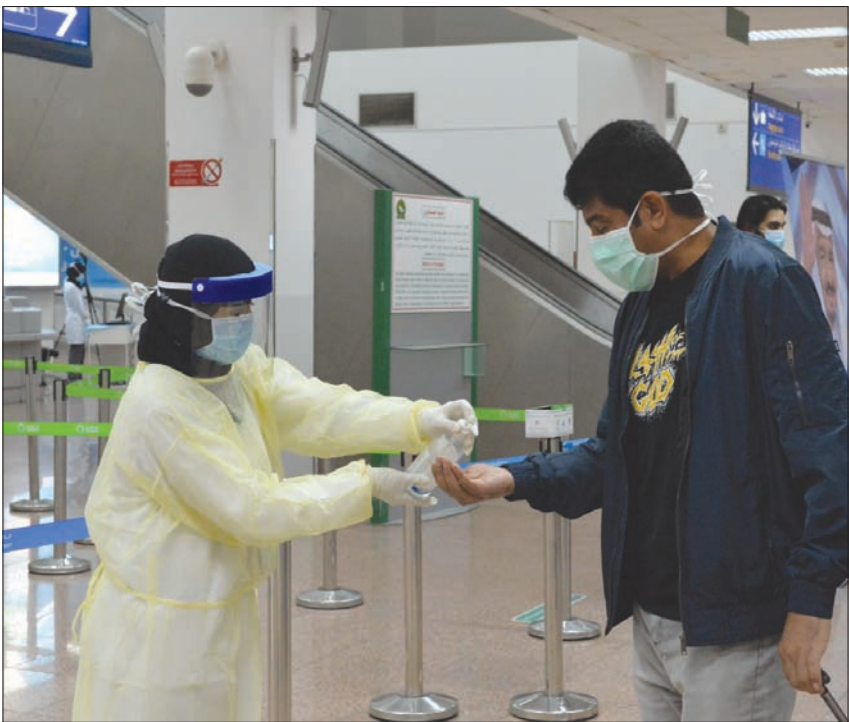
أحد ركاب رحلتي الخرطوم وتونس اللتين وصلتا إلى مطار الملك عبدالعزيز الدولي في جدة (واس)

قرار إغلاق المدينة الصناعية الثانية بالدمام بعد أن كشف المسح العشوائي الذي تجريه الفرق الطبية التابعة لوزارة الصحة وجود حالات إصابة بين العمال في المدينة الصناعية، وقال مصدر في الشؤون الصحية بالمنطقة الشرقية إن عملية المسح العشوائي للمدينة الصناعية انتهت لذلك اتخذ قرار عزل المدينة وإغلاقها.