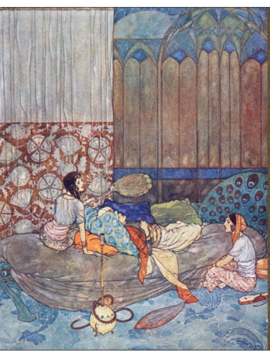
رسم للفرنسي أموند دولاك مستوحى من «الف ليلة وليلة»

بتفصيل في حكاية السنديباد، وأن يجد الصلة الوثيقة بين هاتين القصتين وشبيه لهما في رواية بلزك «أوجيني غراندي». لتلرى أن ثمة بنية مشتركة يمكن رصدها، من خلال معرفة عميقة بنصوص سردية كبيرة في لغات مختلفة. وهو هنا يثبت مرة جديدة كم أن الليالي جذرية بمقارنتها بكبريات النصوص الخثرية، بل كونها مرجعاً أدبياً أساسياً تأثر به أدباء كبار بلغات مختلفة، بقيت مسات شهرزاد بنية على كتاباتهم، دون أن يهتم أحد برصدها، وتحري عمقها. وثمة أكثر من ذلك، فطريقة كليبو في كتابة تحليلاته وتسلسلها، وفي انتقاله في النصوص واللغات والكتاب، وعودته في كل مرة إلى الليالي، هي تماماً كطريقة شهريزاد نفسها في إخراج القصة من القصة، وعلى غرار أسلوب الصبية التي عاقلت الجني في مطلع كتاب «الف ليلة وليلة»، وجمعت الخواتم الكثيرة في كسب واحد.