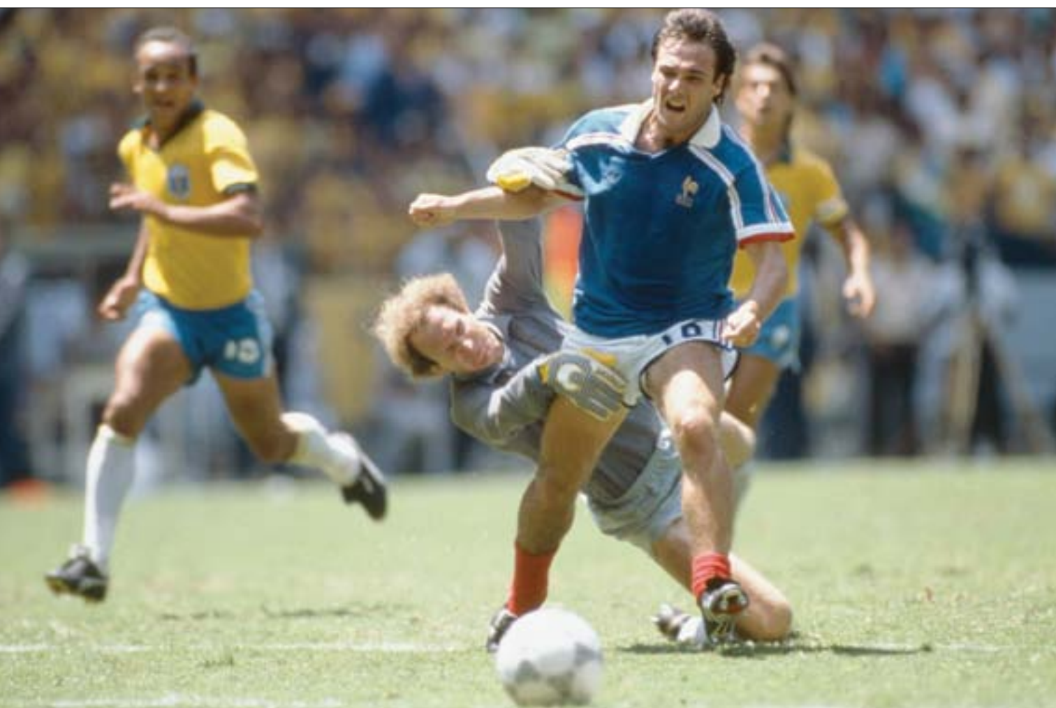
كارلوس حارس البرازيل يعرقل اللاعب ايلون ما جعله يقشلق في إحراز هدف محقق لمنتخب فرنسا في مونديال 1986

وكاد التردد بقتلني. في بعض الأحيان كنت أقول لنفسني وأنا في صفوف المنتخب الوطني إنه يتعين علي أن أطور واحسن مستواي بشكل أفضل، لأن هناك حراس مرمى آخرين يمكن أن يكونوا في مكاني. ومع ذلك، كنت دائماً ما انضم لصفوف المنتخب الوطني. كان لدي شعور بالتناقض، فقد كنت أقول لنفسني: أنا هنا لكن لا يمكنني أن أكون هنا، لكن يجب أن أكون هنا لأنني جيد بما يكفي لكي أكون في صفوف المنتخب الوطني». في الواقع، إن هذه الشكوك والمشاعر المتناقضة هي التي تجعله بشراً عادياً، وليس مجرد شخص متحجر نراه على الشاشة يقوم بخداع حكم المباراة في نهائيات كأس العالم قبل أكثر من ثلاثة عقود. وهناك بعض اللاعبين الذين يشعرون بالفخر والاعتزاز عندما تسلط عليهم الأضواء، لكن كارلوس يمثل الجانب الآخر من ذلك، حيث يشعر بالقلق والخوف ويتوقع دائماً تعرضه للانتقادات.