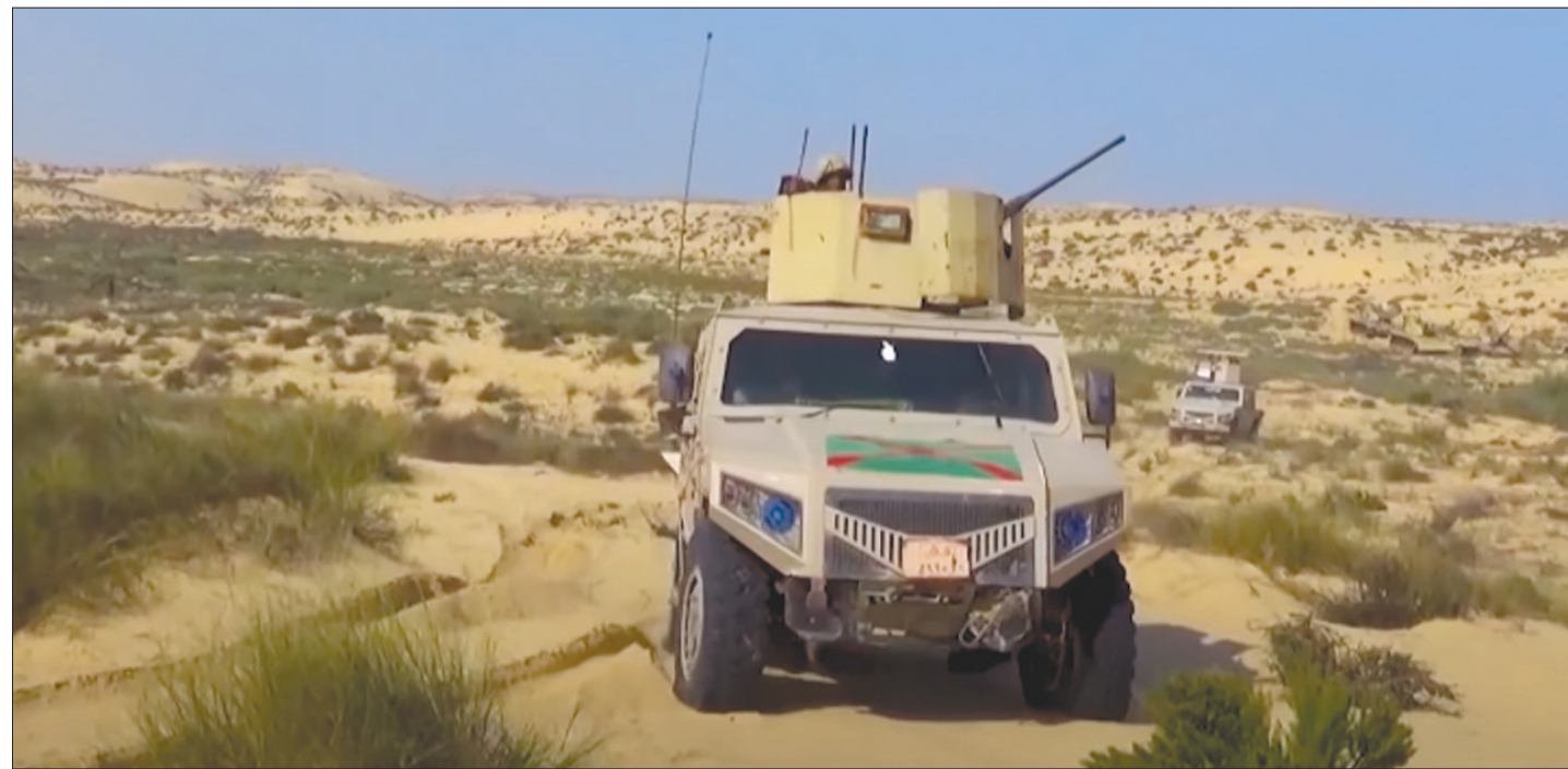
مركبات تابعة لأجهزة الأمن خلال تحركها في سيناء (مقطع مصور بثه المتحدث العسكري المصري)

فإن 15 من عناصره سقطوا ضحايا ما بين قتل وجرح. ونقل البيان تأكيد «القوات المسلحة والشرطة على استمرار جهودهما في القضاء على الإرهاب واقتلاع جذوره وتوفير الأمن والأمان لشعب مصر». في السياق ذاته، قالت الداخلية المصرية، أمس، إن «18 إرهابياً قتلوا في تبادل لإطلاق النار لدى استهداف وكرهم في محيط بئر العبد، ويجوزتهم عدد من الأسلحة والمتفجرات». واعتبرت في بيان رسمي، مساء أول من أسس، أن المداومة جاءت «استمراراً لجهود الوزارة