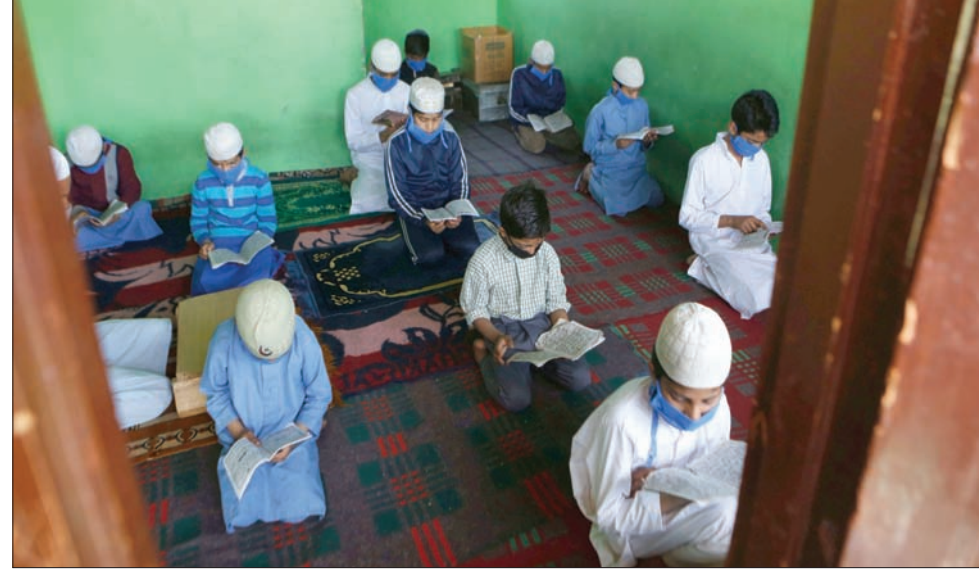
أطفال يقرأون القرآن الكريم في دار أيتام بسريناغار الأربعة

تصر على التبرع بالبلازما مساعدة غيرها من المرضى، أما بالنسبة لي، استطيع القول بانني يمكنني التبرع بكل أعضاء وخلايا جسدي، إن لزم الأمر، من أجل المساعدة في اختبار أي لقاحات ممكنة قيد التطوير للقضاء على هذا المرض. ويمكن جمال بلاد الهند في أن الناس الذين يعتقدون بالديانات المختلفة يعيشون سوياً. ولا ينبغي ربط انتشار وباء كورونا بمجتمع أو جالية معينة من سكان البلاد. ولقد أخبرني الأطباء أن اثنين من المرضى من طائفة الهندوس قد استفادوا من التبرع ببلازما الدم من المسلمين.