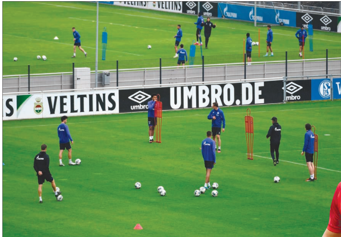
لاعبو شالكه انتظموا بالكامل في مركز تدريب النادي بانتظار قرار استئناف الدوري

الفرنسي أسدلت الستار على الدوري المحلي بعد قرار الحكومة بالسماح بفتح مقرات التدريب حتى سبتمبر (أيلول) وأعلنت باريس سان جيرمان بطلا للدوري المحلي. وفي إيطاليا يبدو أن الحكومة الإيطالية في طريقها للسماح باستئناف تدريبات فرق كرة القدم مبكرا، بعد حصول العديد من أندية دوري الدرجة الأولى على موافقة المجالس البلدية مع التخفيف التدريجي للإجراءات الاحترازية المتعلقة بفيروس «كورونا» المستجد. واستفادت بعض المناطق من إجراءات تخفيف قيود الحظر في البلاد وقررت منطقة إميليا - رومانيا (شمال) التي تتبع لها أندية بارما، وسيليا، وساسولو، وكامبانيا (جنوب) التي تتبع لها نادي نابولي السماح لتلك الأندية بفتح مراكز التدريب، ولكن دون تجمعات. وكررت أندية الدوري الإيطالي رغبتها بإنهاء الموسم الكروي، التي سمحت بذلك السلطات الرسمية التي يتوقع أن تتخذ قرارها في الأيام القليلة المقبلة. وكان نادي ساسولو وبولونيا أول من أعلن عن فتح أبواب مراكز التدريب للاعبين قبل أن يلحق بهما بارما. وأوضح ساسولو أن مركز التدريب سيكون متاحا للاعبين الراغبين. ويمكن أن يخوض ستة لاعبين فقط التدريب في وقت واحد دون استخدام غرف الملابس لتحتاشي تفشي الفيروس، مع احترام مسافة التباعد الاجتماعي ودون وجود للجهاز الفني. من جهته، أوضح بولونيا أن ملاعب التدريب ستكون متاحة بدءا من الغد، فيما رأى بارما أنه «بدءا من الأسبوع المقبل» ستكون التمارين متاحة فقط «للمرارين ولتنشيط جسدي فردي». ويمكن لمناطق أخرى أن تحذو حذوها، على غرار إقليم لاسبو الذي يضم فريق روما ولاتسيو وأقليم سيردينيا