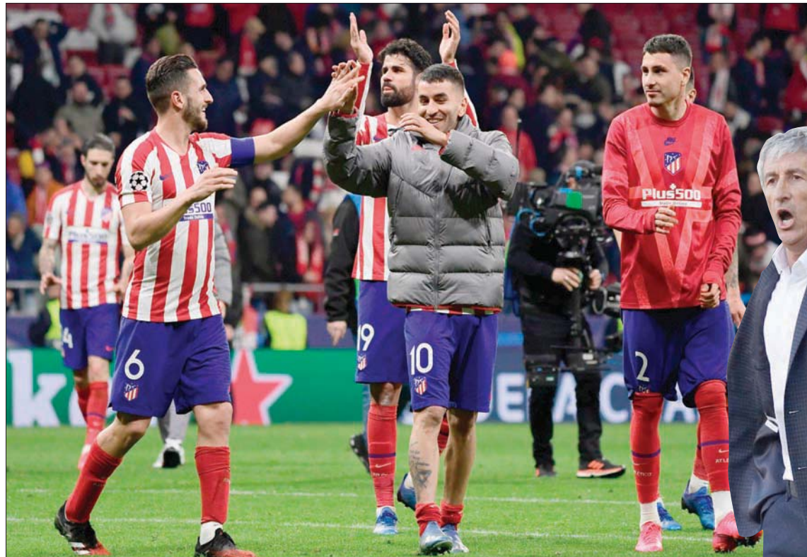
لاعبو أتلتيكو بعد إطاحتهم ليفرول في نسخة دوري الأبطال الحالية

لكن مدرب برشلونه كيكسي سيبتين قال في حديث إذاعي «الجميع يريد أن يكون جاهزاً عند استئناف الموسم،