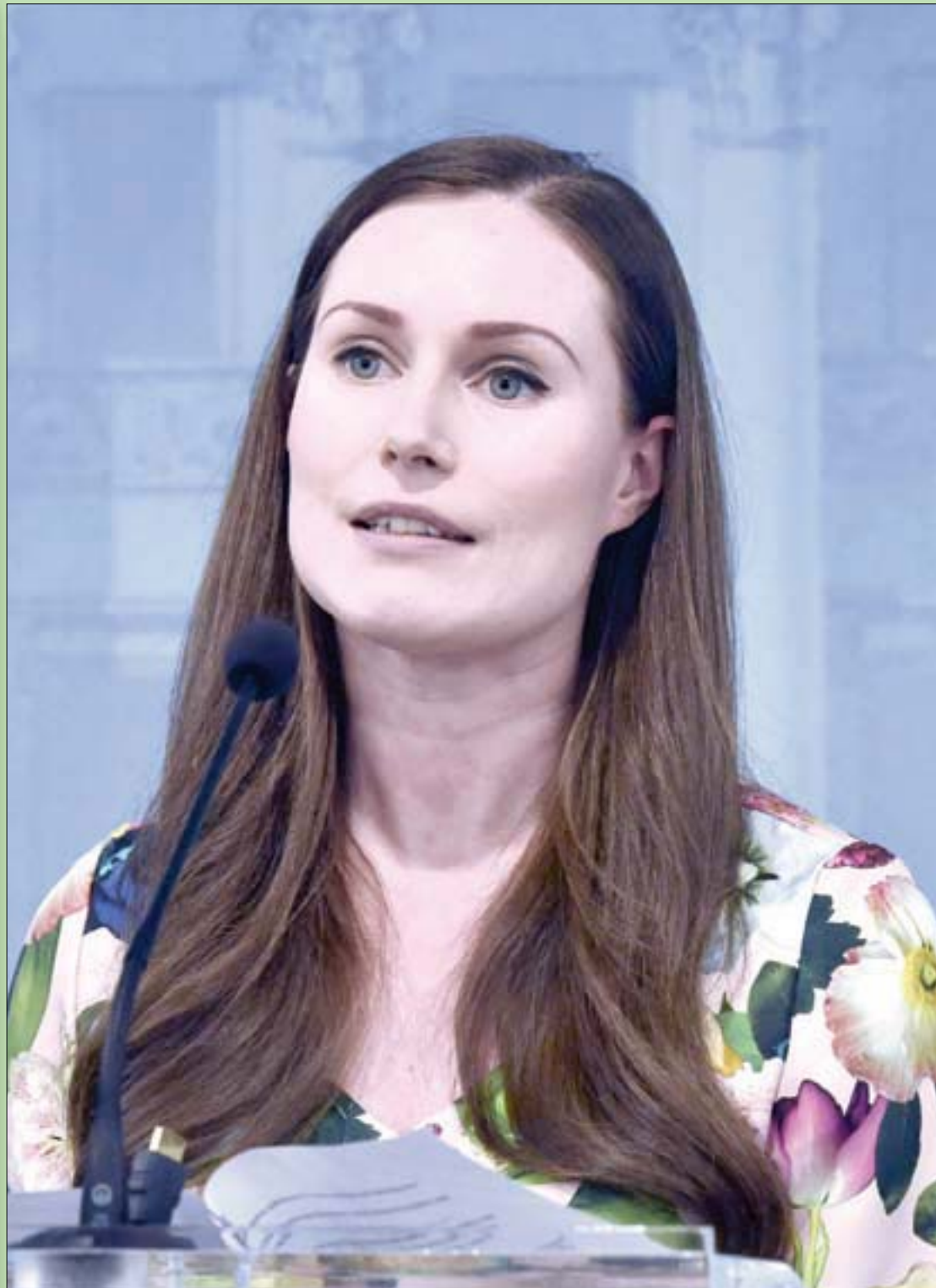
رئيسة وزراء فنلندا سانا مارين أثناء إلقاء كلمة في هلسنكي حول إطلاق برنامج لدعم الصحة النفسية خلال الأزمة الحالية

من أشعار الشاعر العباسي أبي نواس هذان البيتان... خَلَفْتُ الجمال لنا فتنة *** وقلت لنا يا عماد اتقون وانت جميلٌ تحبُّ الجمال *** فكيف عباؤك لا تعشقون قرء عليه الشيخ أبو عبد الرحمن بن عقيل، والقمه حجرًا عندما قال ما معناه: إن مثل هذا الشعر يعتبر من الجمال القبيح، أو المتخثر بلا جمال ولا قبح. وأنا بدوري، أقول لابن عقيل: صح لسانك، وإنني أدعو لك صادقاً، وأقول: سلمت براجمك من الأوخان.