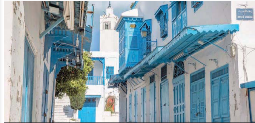
كشفت بيانات حكومية تونسية بتباطؤ الاقتصاد في الربع الأول من العام نتيجة لتراجع الأنشطة

نسبة البطالة الحالية ما بين 1,5 و4,1 في المائة من العاطلين خلال الفترة المقبلة.