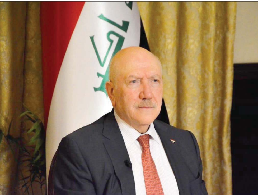
الدكتور جعفر علاري

كشف وزير الصحة العراقي الدكتور جعفر علاري أن نحو 6600 مواطن عراقي غالبيةهم من الطلبة يريدون العودة إلى البلاد بسبب تفشي وباء «كورونا» في الدول التي يقيمون أو يدرسون فيها. وأضاف في تصريحات لـ«الشرق الأوسط»: «بدأنا الإجراءات الخاصة بذلك حيث يوجد الآن 2000 عراقي تجري عملية إعادتهم وفق رحلات طيران منظمة حيث أعدنا كل ما يلزم لهم عند العودة من حيث إجراءات الفحص والإقامة في الفنادق التي تم تحضيرها لهذا السبب». ولفت الوزير العراقي إلى أن «غالبية العراقيين الذين يرومون العودة هم من بلدان أوروبية بالإضافة إلى تركيا وإيران وعمان والإمارات بتم فحصها وفي حال وجد أحد من العائدين مصاب بمرض كحجر كل ركاب الطائرة لمدة 14 يوماً كما يتم تغيير الطائرة وفي حال لا يوجد أحد يتم الحجر في البيوت للمدة المقررة مع متابعتهم من قبل وزارة الصحة».