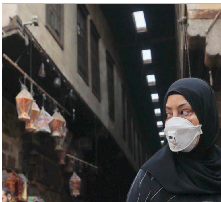
سيدة تسوق في القاهرة استعداداً لشهر رمضان الفضيل

بواجبها العالم اليوم جراء «كورونا» المستجد تعد أكبر تحد يواجهه العالم، مما يجعلها موقفاً رئيسياً لتحقيق أهداف التنمية المستدامة، لا سيما الهدفين الأول والثاني الخاصين بمكافحة الفقر والجوع في العالم». وبحسب صفحة «الخارجية» فإن السفير بدر أشار إلى أن التحدي غير المسوق جراء جائحة (كورونا) يتطلب تكثيف التعاون والتنسيق بين منظمات الأمم المتحدة ومؤسسات التمويل الدولية والشركاء والحكومات من أجل العمل على احتواء انتشار هذا الوباء وتخفيف تأثيراته السلبية على جهود تحقيق الأمن الغذائي والتغذية، لا سيما في الدول التي تعاني من ضعف مؤسساتها الطبية ونقص الغذاء مثل أفريقيا... وشدد على أهمية قيام منظمات روما الثلاث بالعمل معاً على صياغة خطة استجابة موحدة لدعم الدول الأفريقية لضمان إصالح إمدادات الغذاء إلى الفئات الأكثر احتياجاً والجوعى واللاجئين في مناطق الأزمات والحيلولة دون تفاقم تداعيات أزمة الفيروس».