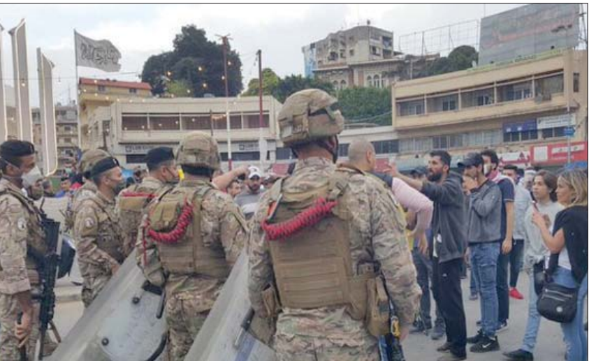
إحدى الصور التي تناقلها ناشطون على مواقع التواصل الاجتماعي من احتجاجات طرابلس

تعتزم الحكومة توزيعها على العائلات الأكثر فقراً، شريحة من سكان طرابلس التي تضم في أحيائها الفقيرة واحدة من أكبر نسب الفقراء في لبنان. وكانت عائلات من الذين أصيبوا بالانحماض منذ عام 1975، وعائلات المتوفين منهم في طرابلس، إلى جانب مدن أخرى، تلقت مساعدات اجتماعية للمتوطنين وزعتها وحدات الجيش اللبناني؛ حيث تم تسليم مبلغ 400 ألف ليرة لبنانية لكل عائلة وفقاً للوائح الواردة من مجلس الوزراء، واستناداً إلى قاعدة بيانات المركز اللبناني للأعمال المتعلقة بالألغام، بحضور مختار المحلة أو ممثلين عن البلدية.