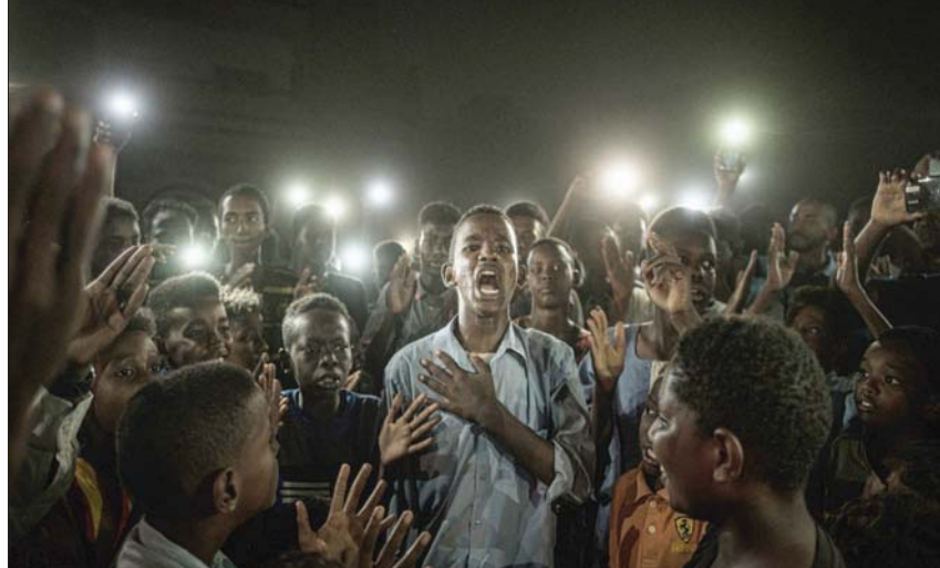
الصورة الفائزة بمسابقة التصوير الصحافي «وورلد برس فوتو 2020» لمصور وكالة الصحافة الفرنسية ياسويوشي تشيبينا (أ.ب)

وقال ياسويوشي تشيبينا إنها «الجائزة الأرفع مستوى في عالم