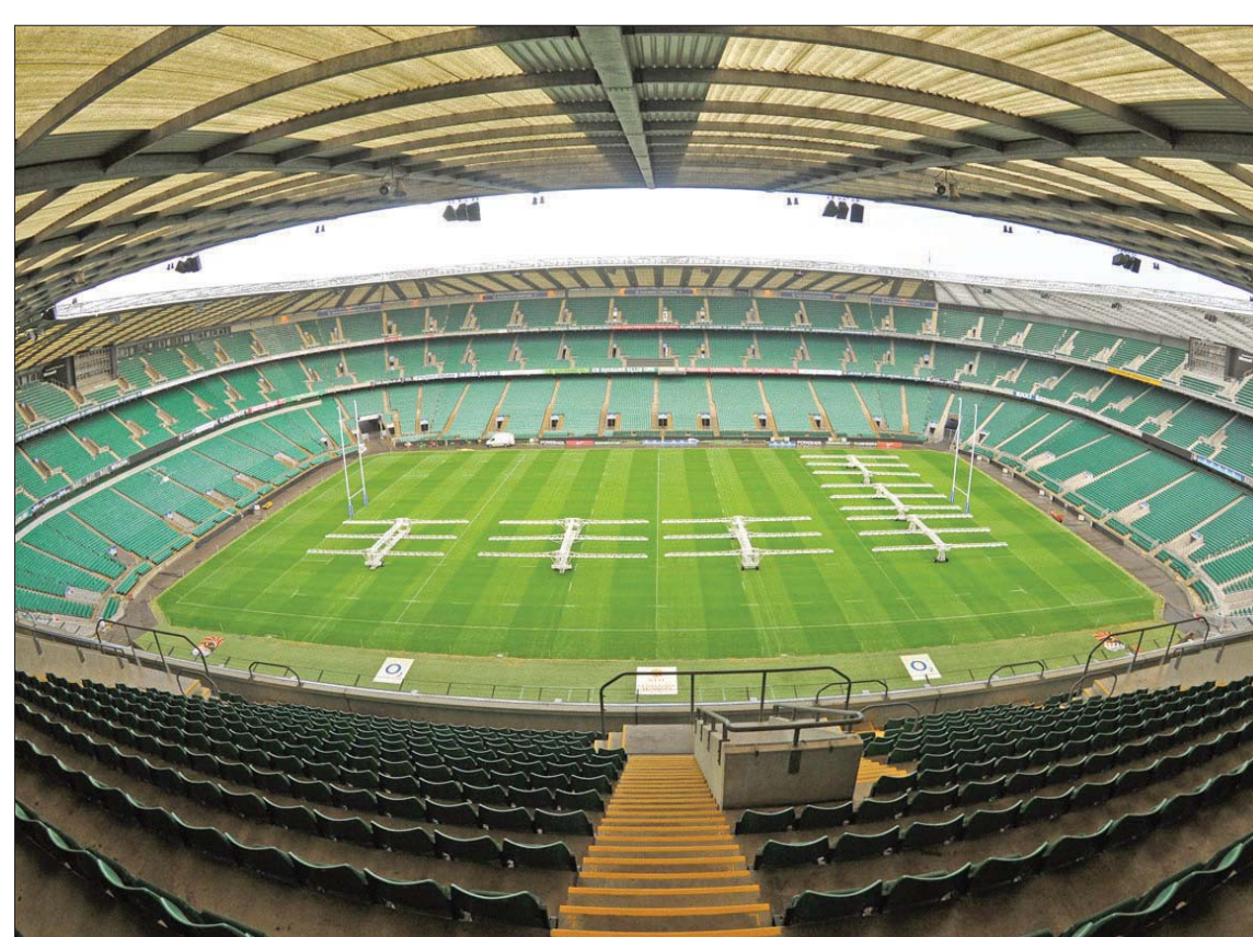
ملاعب صامتة في كل الأنشطة الرياضية بعدما كانت تعج بالضجيج

وفي الوقت نفسه، كانت سباقات «الفورمولا وان» ستعلن أنها ستوقف بشكل فوري، بعد أن أعادت تقييم مكانتها في المجتمع البشري وتخلت عن دورها كأحد مسابقات تولد البهجة بالغازات الكربونية من أجل إمتاع مجموعة من الأثرياء؛ وبعيداً عن كل هذا، كان سيتم الإعلان عن تأجيل «صارافون لندن»، لكن لن يتم تأجيل دفع 50 مليون جنيه إسترليني من التبرعات الخيرية المتعلقة به. وفي جميع أنحاء البلاد، لم يكن 350 ألف لاعب «كريكيت» من