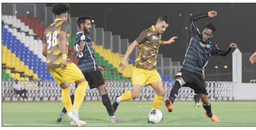
من منافسات دوري الدرجة الأولى (الشرق الأوسط)