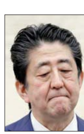
«من فضلكم تجنبوا الخروج... إن التقليل من الاختلاط بين الأفراد في (مدينتي) طوكيو وأوساكا (أشد المناطق اليابانية تضرباً بفيروس كورونا) لا يزال دون المستويات المستهدفة. كل شيء يعتمد على تصرف كل فرد».