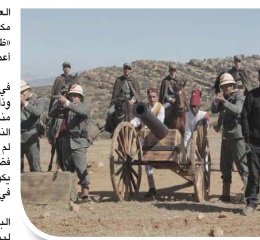
المخرج الليبي أسامة رزق يتوسط فريقاً من الممثلين في مشهد من «الزعيمان»

المهدي يقودونه في بقية أقطار الوطن العربي في مرحلة التحرر الوطني والكفاح من أجل الاستقلال». كما حظي الباروني وفقاً لمؤرخين ليبينين «بالقدر نفسه» لكونه يعد من الع قادة النضال في ليبيا. ولخت رزق إلى أن هذا العمل الذي يعرض حصرياً على قناة «سلام» الليبية وفي توقيت مختلف في بعض القنوات العربية، هو نتاج 6 أشهر من البحث وتجميع المواد التاريخية من 7 دول عربية، بداية من عام 2019، واستغرق كتابة السيناريو خمسة أشهر، ومرحلة للتحرير، و11 أسبوعاً في التصوير، وقال «تم تصوير العمل في 6 مدن تونسية، بالإضافة إلى بناء الكثير من الديكورات الخارجية والداخلية، مثل شارع الحسين بالقاهرة، وشارع إسطنبول، وطرابلس، وتونس، وسوريا.