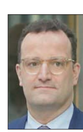
«ففيروس كورونا المستجد» بات تحت السيطرة... أعداد الإصابات انخفضت بشكل كبير، وخصوصاً الارتفاع النسبي على أساس يومي. التفشي بات الآن مجدداً تحت السيطرة... وعلينا تعلم كيفية التعايش مع الفيروس، والناس أبدوا حتى الآن مسؤولية كبيرة».