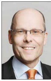
«جري الاستخفاف بالجانحة وباء كورونا» لفترة طويلة... الخلافات بين الرئيس الأمريكي (دونالد ترمب) وعدد من حكام الولايات كانت مبالغا فيها جزئياً، وغير ضرورية... لكن الخطة الجديدة طريقة مجدية واقعية للعودة إلى الحياة الطبيعية».

مسنق الحكومة الألمانية للعلاقات عبر الأطلسي بيتر باير