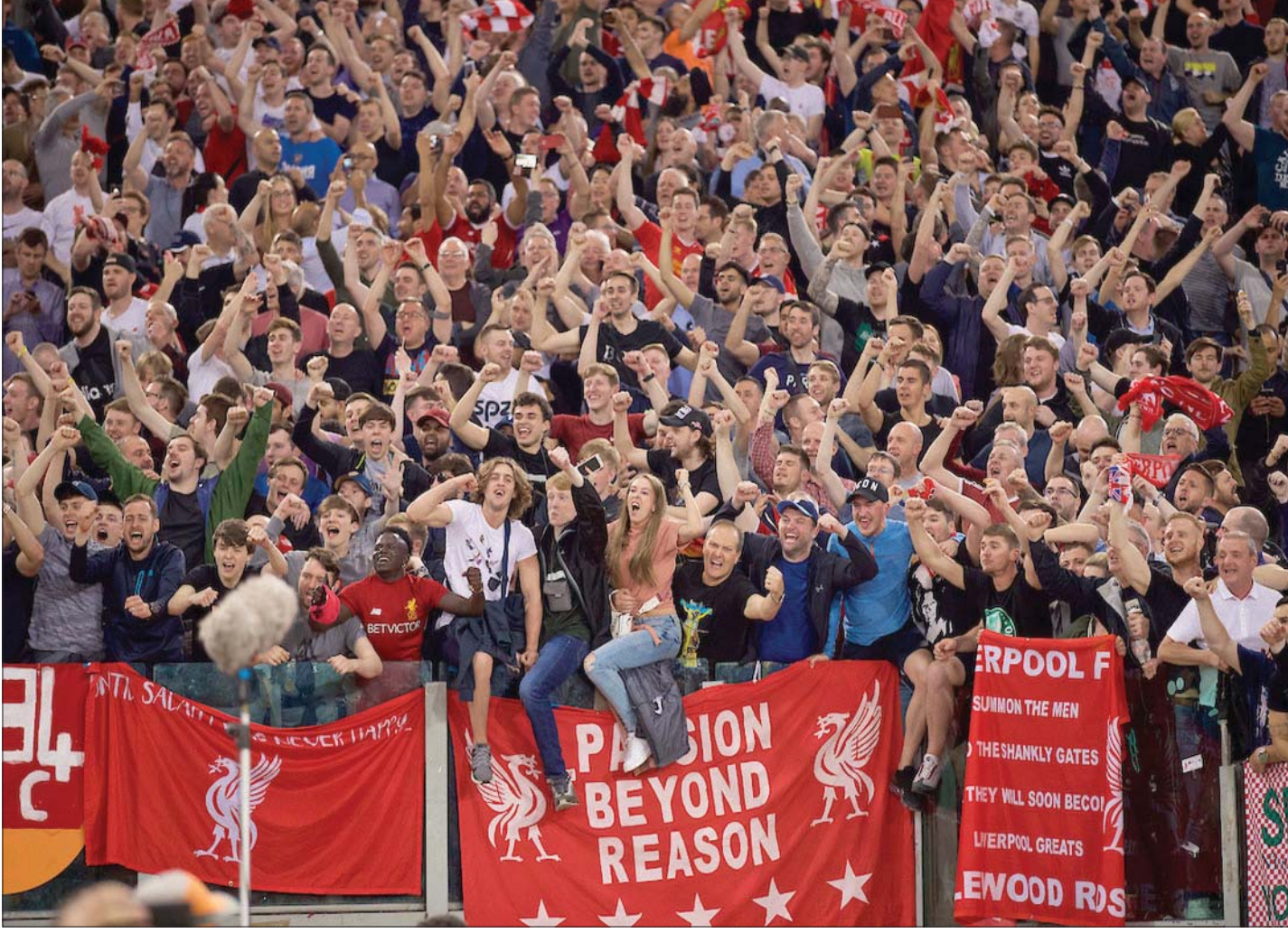
جماهير لليفربول أجبرت مالكي النادي على التراجع عن الاستفادة من الأموال الحكومية

أما بالنسبة لنادي، فقد أخبر ممثل للعديد من كبار اللاعبين صحيفة «الويزيرفر» أنهم كانوا على علم بأن نايت قد كتب كتاباً في عام 2004 يقدم فيه نصائح للهروب من دفع الضرائب، بما في ذلك اقتراح بأن يفكر الناس في الهجرة لتجنب دفع ضريبة الميراث. وقال وكيل اللاعبين إن لاعبيه، الذين يدركون تماماً أنهم يدفعون ضرائب بملايين الجنيهات، لم يفهموا الأسباب التي تدفع نايت لاتهام كرة القدم بأنها تعيش في «فراغ أخلاقي»، مشيرين إلى أنهم لا يرون أن نايت يمتلك المؤهلات التي تمكنه من أن يكون ناشياً بالبرلمان. وأخبرت «الويزيرفر» نايت بهذا التصريح بعد أن أصدر بياناً آخر الأسبوع الماضي وصف فيه الدوري الإنجليزي الممتاز بأنه «مضحك»، قائلاً إن الأندية لا يتعين عليها أن تعتمد على الخطة الحكومية لدفع رواتب موظفيها، لكن نايت لم يرد على هذه التصريحات.