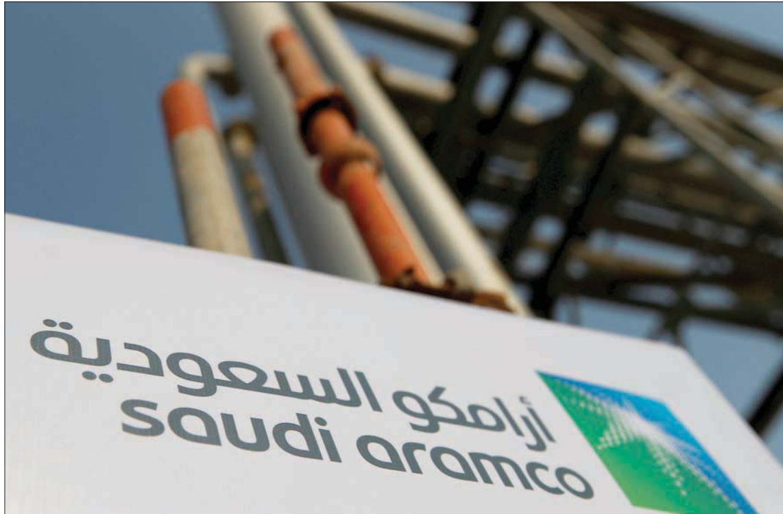
كشفت «أرامكو» أمس عن تخفيض صادراتها اعتباراً من مطلع الشهر المقبل إلى 8,5 مليون برميل

وحسب وزير الطاقة السعودي الأمير عبد العزيز بن سلمان، من المتوقع أن تبلغ عمليات الشراء لاحتياجات 200 النفط الاستراتيجة للدول 200 مليون برميل في شهري مايو ويونيو، ما يعني أن حجم الخفض الحقيقي سيصل إلى 19,5 مليون برميل يومياً، مؤكداً أن بلاده قد تقلص إنتاج النفط إلى أقل من 8,5 ملايين برميل يومياً إذا اقتضى الأمر.