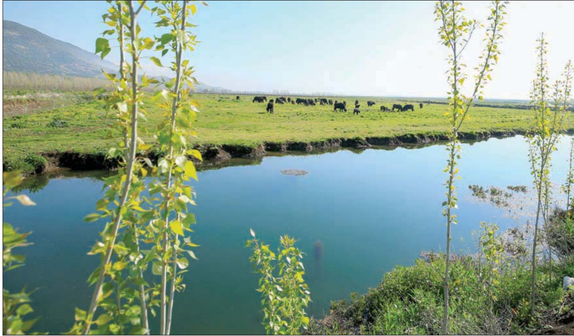
دفع فيروس كورونا اللبنانيين إلى النزوح من المدن إلى الريف وتظهر الصورة جانباً من منطقة عميق في سهل البقاع بشرق لبنان

المصادر التلوث التي تفرضها الحياة في المدن، ففي القرى، تساهم المسافات بابتعاد الناس بعضهم عن بعض، وتخفف من الاستهلاك والتنقل، وتشجع الإنسان على الاهتمام بارضه، وزراعة بعض ما يحتاج إليه. كما تعيد النفايات العضوية إلى الأرض، سواء بتخميرها ثم تسميد الأرض بها، أو رميها مباشرة لتعود تراباً، عوضاً عن كيميائها في الأكياس البلاستيكية، وإرسالها إلى المكبات والمطامر. لكن الأهم، كما يرى معلوف، أن «عودة الإنسان إلى الريف تؤدي إلى مصالحة مع نفسه، وتحسين نوعية تفكيره، بعيداً عن التنوير الناجم عن الضجيج، وعن متطلبات الحياة اليومية في المدن. ففي القرى، تنتهي مثل هذه الضغوط». لكنه يشير إلى «ضرورة توفير الخدمات الأساسية في المناطق النائية، وتحديداً خدمة الإنترنت، وتوافر السلع الأساسية، وتسهيل إنجاز المعاملات الضرورية، كما هي الحال في المدن ومناطق الاضطراب الجبلية التي تتوافر فيها كل هذه التجهيزات والخدمات».