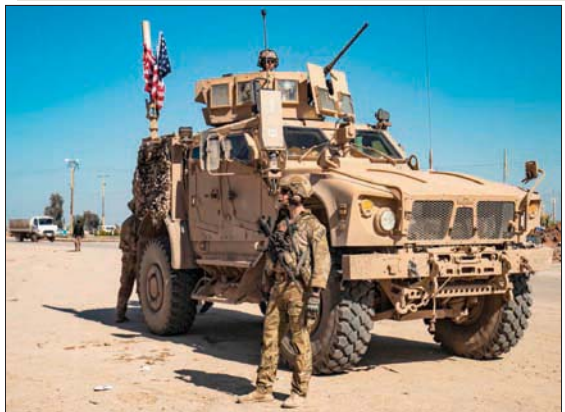
دورية عسكرية أميركية على طريق حلب - الحسكة شمال شرقي سوريا