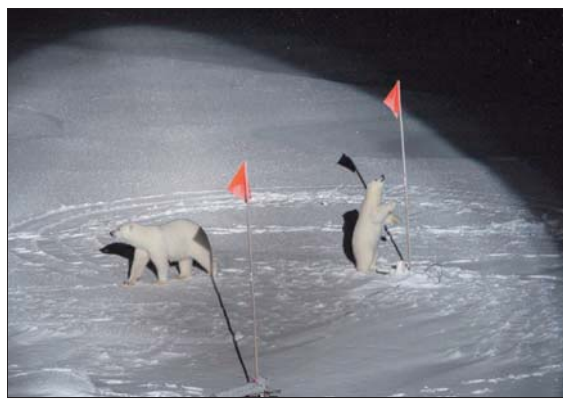
الصورة الحائزة على الجائزة الأولى في مجال التصوير البيئي ضمن مسابقة التصوير الصحافي

البلاد، في المرتبة الثانية للمصور المرموقة في فئة «فضايا معاصرة». ويتمتع ديفي المقيم في استراليا حيث يتم عرض أعماله له بانتظام، بخبرة من أكثر من عشرين عاماً في تغطية أخبار البلاد.