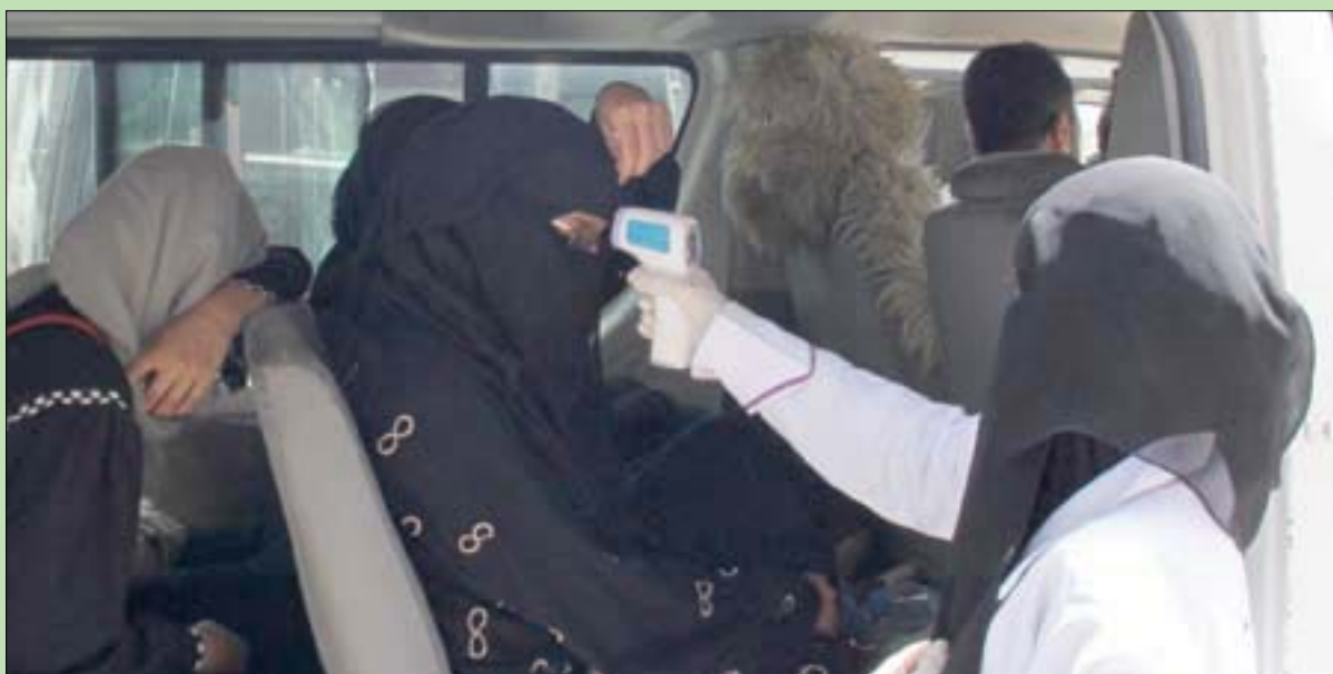
موظفة في القطاع الطبي تفحص امرأة في تعز

نيويورك، علي بردى غداة الإحاطة التي قدمها المبعوث الخاص للأمم المتحدة إلى اليمن مارتن غريفيث، رحب أعضاء مجلس الأمن بقرار وقف النار الذي أعلنته المملكة العربية السعودية، باسم تحالف دعم الشرعية في اليمن، من جانب واحد وبالرد الإيجابي للحكومة اليمنية المعترف بها دولياً، مطالباً بجماعة الحوثي المدعومة من إيران بـ«تقديم التزامات مماثلة من دون تأخير». وفي بيان وزع على الصحافيين المعتمدين لدى المقر الرئيسي للأمم المتحدة في نيويورك، أعلن أعضاء مجلس الأمن تأييدهم لنداء الأمين العام للمنظمة الدولية أنطونيو غوتيريش، بتاريخ 25 مارس