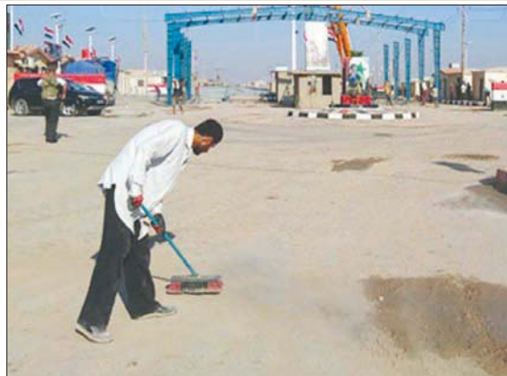
معبر البوكمال. القائم على الحدود السورية - العراقية الذي شجعت إيران على افتتاحه (سانا)

جانب الولايات المتحدة لتوسيع نطاق نفوذها داخل الأنبار وغرب العراق. وبجانب حقيقة أن القوات الأميركية تسيطر على الفضاء الجوي بالمنطقة وتطلق مناورات استطلاع من قاعدتها الجوية في الأنبار، رأت بعض الفصائل الموالية لإيران المشروع جزءاً من خطة طويلة الأجل لترسيخ الوجود الأميركي في المحافظة وتحويلها إلى قاعدة للتشاورات المناهضة لإيران.