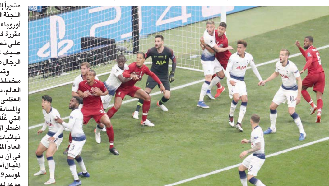
نهائي دوري الأبطال في نسخته الماضية بين ليفرول وتوتنهام التي توج بلقبها «الحمراء»

ودخل الاتحاد القاري في تجاذب مؤخراً مع رابطة الدوري البلجيكي لكرة القدم، بعد توصية مجلس إدارتها بوقف الموسم بشكل مبكر وتتويج المتصدر كلوب بروج باللقب. ويعد هذا لؤح الاتحاد القاري بحرمان الأندية البلجيكية من مسابقات بحال اتخاذ السلطات المحلية قراراً من هذا النوع بشكل متسرع، دخل الطرفان في مفاوضات أفضت إلى تأجيل الرابطة موعد عقد جمعيتها العمومية للبت