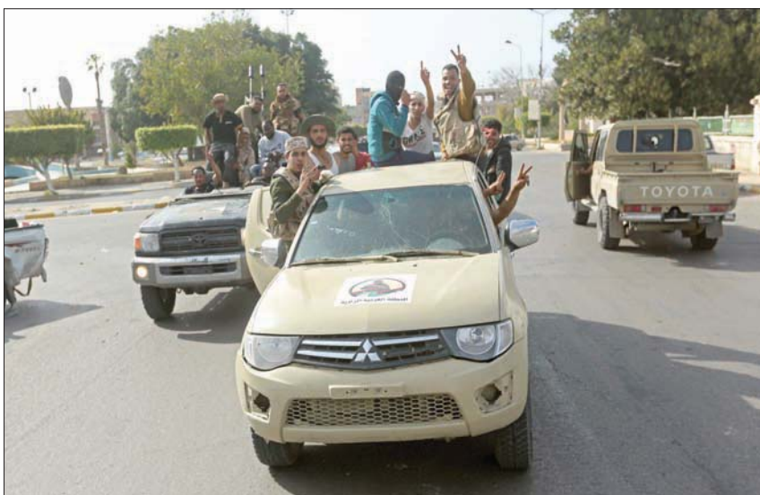
ميليشيات موالية لحكومة «الوفاق» تجوب شوارع مصراتة