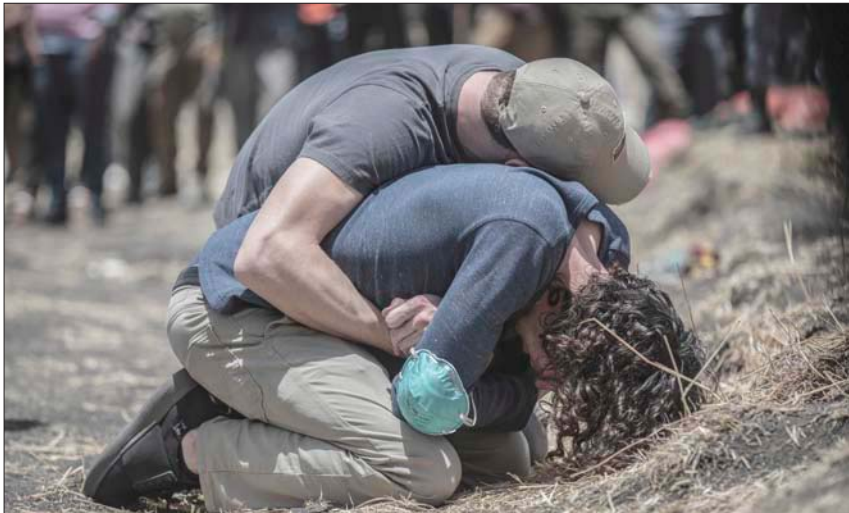
صورة التقطها مصور «أسوشيتيد برس» مولوغيتا آيين لأقارب ضحايا الطائرة الإثيوبية التي تحطمت العام الماضي وقد حصلت على إحدى جوائز «وورلد برس فوتو 2020» (أ.ب)

وقد فاز المصور الفرنسي رومان لورندو بالجائزة الأولى في الفئة الرئيسية الأخرى «التقرير المصور للعام» بسلسلة من الصور بالأبيض والأسود عن الشباب الجزائري خلال الحراك في الجزائر العام الماضي.