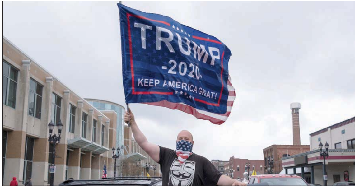
مظاهر داعم لترمب يحتج ضد تدابير الحجر في ميشيغان

بلاذنا، أميركا تريد أن تكون مفتوحة، والأميركيون يريدون ذلك. الإغلاق الوطني ليس حالة مستدامة لبلاذنا. علينا أن نستعيد اقتصادنا. سنبدأ في تنشيط اقتصادنا بطريقة آمنة ومسؤولة ومتدرجة». وبدا واضحاً أن ترمب تراجع عن تهديداته بمواجهة حكام الولايات، مفضلاً اعتماد خطاب يشجع على الإيجابيات التي تحققت في مواجهة المرض، والتعبئة مؤيديه ومناصريه مجدداً، مع إطلاق سبابة الرئاسي الثاني مع منافسه الديمقراطي الوحيد جو بايدن.