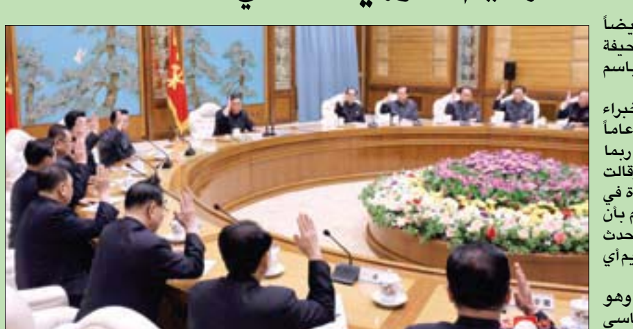
الزعيم الكوري الشمالي يتراس اجتماعاً للحزب الحاكم السبت الماضي في آخر ظهور علني له

في السابق. ولم يظهر كيم أيضاً في الصور التي نشرتها صحيفة «رودونغ شينمون» الناطقة باسم حزب العمال الحاكم. وأثار غيابته تكهنات بين الخبراء بأن كيم البالغ من العمر 36 عاماً والذي يعاني من زيادة الوزن ربما يعاني من مشكلات صحية. وقالت متحدثة باسم وزارة الوحدة في كوريا الجنوبية إنها على علم بأن وسائل الإعلام الحكومية لم تتحدث عن غياب كيم لكنها رفضت تقديم أي تحليل للأمر. وشوهد كيم آخر مرة علناً وهو يتراس اجتماعاً للحزب الحاكم يوم السبت الماضي.