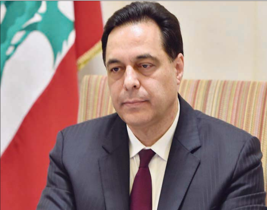
رئيس الحكومة اللبنانية حسان دياب خلال توجيه كلمته المتلفزة