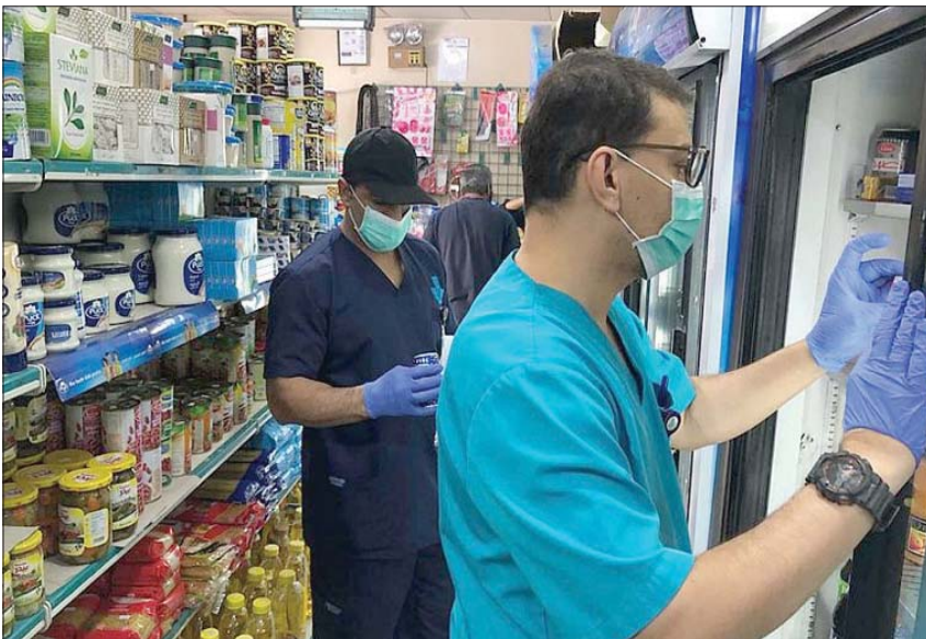
أمانة الشرقية تكثف جولاتها الرقابية على الأسواق الغذائية في محافظة القطيف (واس)

في حين سجلت قطر 560 حالة إصابة جديدة بفيروس كورونا المستجد، ليرتفع إجمالي الإصابات إلى 4663 حالة، فيما أكدت الفحوصات الطبية وفقاً لوزارة الصحة العامة القطرية شفاء 49 حالة ليصبح إجمالي حالات التعافي 464 حالة. وأوضحت الصحة القطرية أن معظم الحالات الجديدة تعود لعمالة وافدة وأن أغلبية تلام ممن تم في الحجر الصحي. وأضافت في بيان أن بعض حالات الإصابة الجديدة تعود أيضاً إلى مخالطين في المنزل أو في العمل لحالات مصابة بالفيروس من مواطنين ومقيمين.