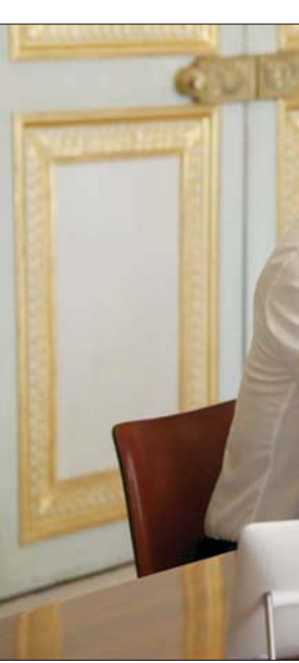
ماكرون ينتقد بكين لكنه يرغب في إقامة جبهة عالمية لمحاربة الوباء وهو في ذلك بحاجة للصين

بالحسن للبلدان النامية، وبينها دول أفريقية، وهي تراهن على كطف ثمارها السياسية لاحقاً. ويمثل الأمر الثاني في أن باريس أخذت تقرب من الموقفين الأمريكي والبريطاني من الصين، مما يعني أن هناك موقفاً غريباً موحداً أخذاً بالظهور، عبر عنه مايك بومبيو وزير الخارجية الأمريكي، أول من أطلق مقوله إن مجموعة السبع الهادي، حيث فرنسا موجودة من خلال جزيرة كاليدونيا الجديدة وجزر بولينيزيا الصغيرة التي يزيد عددها على المائة. كذلك، فإن باريس أخذت تشعر منذ سنوات بالمانسة الصينية في أفريقيا، وتتخوف من مشاريع الصين الكبرى، مثل «طرق الحرير». إلا