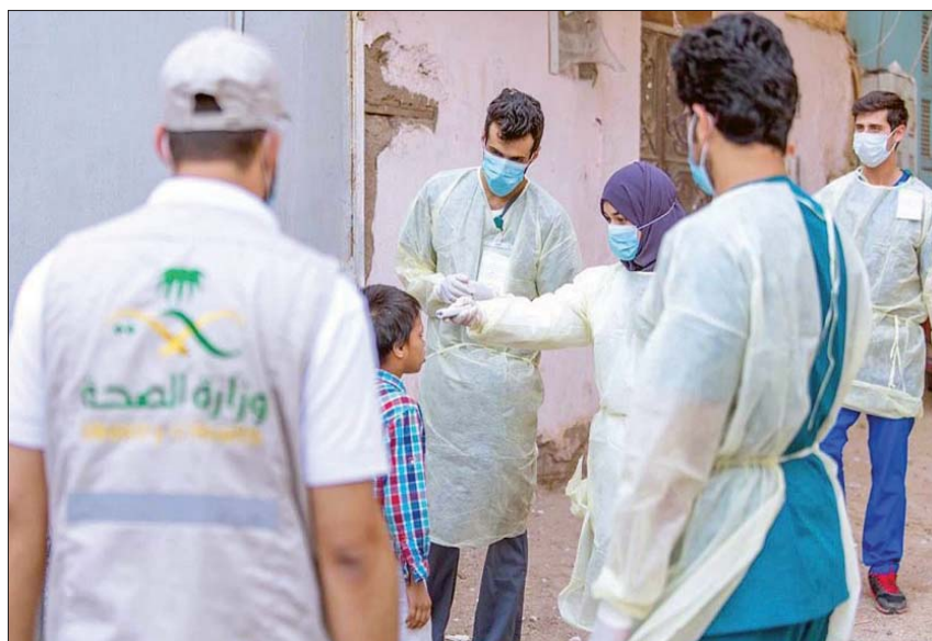
فرق ميدانية ضمن إجراءات المسح النشط

أعلنت وزارة الصحة الكويتية أمس عن تسجيل 134 حالة إصابة جديدة بفيروس كورونا المستجد خلال الأربع والعشرين ساعة الماضية ليرتفع بذلك إجمالي الحالات المسجلة في البلاد إلى 1658 حالة، مع تسجيل حالتين وفاة جديدتين، الأولى لمواطن والأخرى لمقيم إيراني. وكان الشيخ الدكتور باسل الصباح وزير الصحة الكويتي أعلن في وقت سابق أمس شفاء