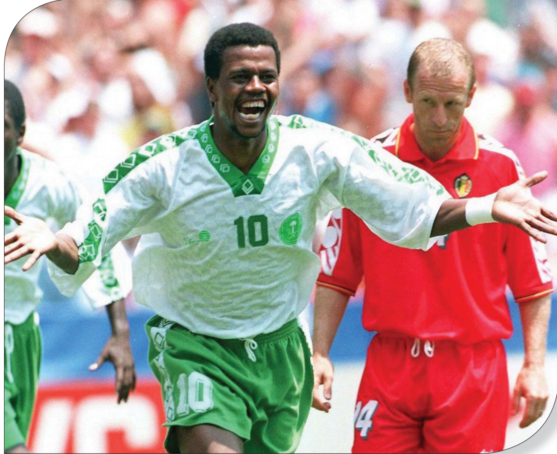
العويران محفلاً ببهده التاريخي في مونديال 1994 (الشرق الأوسط)

الرياض: تركي النديهي شدد سعيد العويران لاعب نادي الشباب والمنتخب السعودي «سابقاً»، على مئانة العلاقة بينه وبين سامي الجابر القائد السابق للهلال والأخضر، وأعرب عن محبته واعتزازه بالجابر «كأخ وصديق»، مشيراً إلى أن هناك من يسعون لإثارة الفتنة والوقعة بينهما. وقال العويران في حديث خاص لـ«الشرق الأوسط»: سامي، رجل محترم واحبه شخصياً، ولا يوجد بيننا أي شيء سوى أنني انتقدته فنياً عندما كان مدرباً لنادي الشباب، وهو كلاعب أسطورة من أساطير الكرة السعودية. ولمح العويران إلى إمكانية انضمامه لنادي الشباب مستقبلاً من خلال العمل الإداري، بحكم علاقته الجيدة وقربه من النادي، مشيراً إلى أنه يفكر جدياً للعودة للركض مجدداً في الملاعب السعودية لنصف موسم على الأقل. وأضاف: وضع الشباب في هذا الموسم وحتى في المواسم السابقة لم يعجبني، فالشباب في تراجع، وهذا ليس الشباب الذي نعرفه. وقال العويران بأن الشباب هو من كبار الأندية السعودية، مشيراً إلى أن الإعلام الرياضي ساهم كثيراً في تجاهل نجوميتهم خلال العصر الذهبي، وأضاف: فرفضنا أنفسنا على الجميع في تلك الفترة، ولاعبو الشباب ساهموا فعلياً