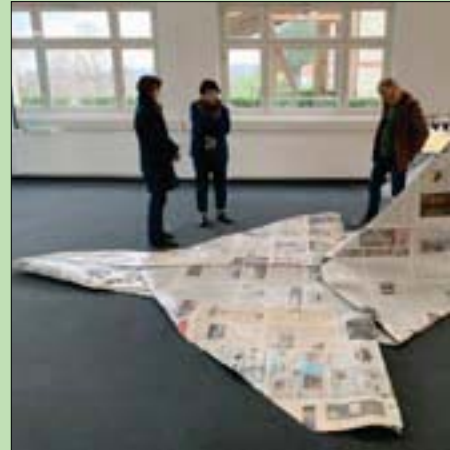
طائرة من ورق الصحف لانتقاد «الأخبار المزيفة»

تصريحاتها له «الشرق الأوسط». وذكرت جاكوميل أنها قامت ببناء الطائرة من أوراق صحف أخضرتها من مدن مختلفة حول العالم بعد زيارتها ومن بينها القاهرة ونيويورك والقدس وغيرها من البلدان الأوروبية، وقد نفذتها بحيث تكون راقدة على الأرض غير مهياة للإلقاء. أعمال جاكوميل المستمدة من التراث العربي والفرعوني لم تقتصر عند حدود التشكيل في الفراغ بل قامت بإعداد فيلم بعنوان «بقايا» تعود فكرته إلى عام 1989 عندما أولى الدكتور حسن رجب اهتماماً