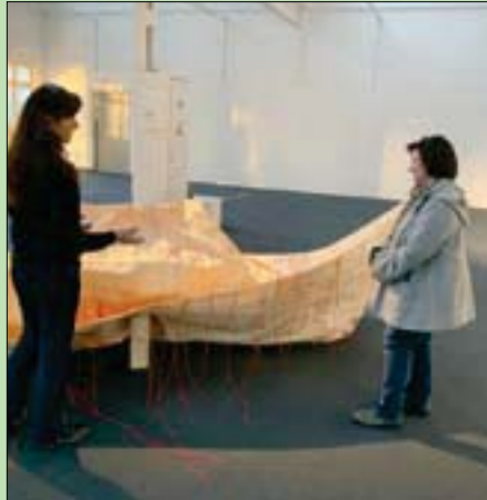
عمل بعنوان «ذكريات الغد»

وصممت الفنانة السويسرية مركبا مساحته متران، من ورق البردي، بجانب طائرة صممها من ورق الصحف بعد معالجتها بطبقة معينة، وكانت مساحتها مترين أيضاً، بالإضافة إلى أعمال أخرى تنوعت بين عروض الفيديو والتكوين في الفراغ، على غرار مجسم شجرة سقطت أوراقها، ووضعتها بشكل مائل وإلى جوارها وضعت بقعة من نسيج الخيامية. تصميص طائرة حربية مصنوعة من ورق الصحف يرمز إلى الخليط المتنوع من الانتشار المفرط للمكتابات المبركة، التي عمد مسؤولو الصحف وكتابها إلى إغراق المجتمع والناس بها، فضلاً عن الأخبار المزيفة والتي تهدف إلى توجيه اهتمامات الناس في طريق معين، بحسب