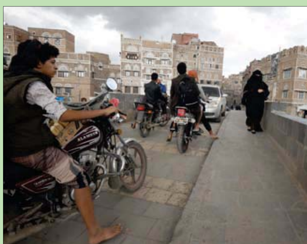
يمنيون على جسر وسط صنعاء

فرضت الجماعة الحوثية في صنعاء وبقية المناطق اليمنية الخاضعة لقيوداً تمنع حركة موظفي الأمم المتحدة والمنظمات الدولية، زاعمة وجود ثلاث حالات اشتباه بينهم بالإصابة بفيروس «كورونا المستجد»، وذلك حسب ورقة تداولها ناشطون يمنيون، ولم يبرح من سلطات الحوثيين أو الأمم المتحدة شيء لنفيها، أو تأكيدها أيضاً. كانت الجماعة قد استغللت مخاطر انتشار الوباء خلال الأسابيع الماضية لكسب المزيد من الأموال ومنع حركة اليمنيين بين المناطق الخاضعة لها والمناطق الخاضعة للشرعية، وهو ما أدى إلى تكسر آلاف المسافرين في المنافذ التي استحدثتها الجماعة بين المحافظات. ولم تسجل في اليمن سوى إصابة حالة واحدة مؤكدة بالمرض في محافظة حضرموت (شرق) حسبما أعلنت الحكومة الشرعية ومنظمة الصحة العالمية. وجاءت المزاعم الحوثية وجود إصابات بين الموظفين الأميين في صنعاء في مذكرة صادرة عن مجلسها الأعلى لتسسيق الشؤون الإنسانية قررت فيها منع تحرك الموظفين الأميين وفرض الإقامة الإيجابية عليهم في منازلهم ومنع وجودهم في مكاتبتهم أو التنقل بين المحافظات. وفي حين أشارت الوثيقة الحوثية المتداولة إلى اكتشاف ثلاث حالات اشتباه بالإصابة بفيروس «كورونا» داخل سكن موظفي الأمم المتحدة، اتهم قادة الجماعة منسقة الشؤون الإنسانية في اليمن ليز غراندي، بأنها امتنعت عن الإفصاح عن أسماء المشتبه بإصابتهم، وهو ما دفعهم لوقف تحركات المنظمات الأممية بين المحافظات ومنع وجود الموظفين المحليين والأجانب في مكاتبتهم في صنعاء ابتداءً من يوم الخميس الماضي.