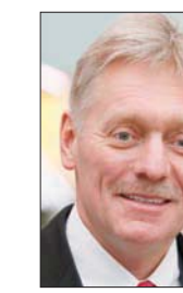
«لم يتم تفعيل الصفقة (حول أسعار النفط) بالكامل بعد، فقد دخلت حين التنفيذ، وتم الانتهاء منها، ولكن يجب إطلاقها من الناحية التكنولوجية وسيستغرق الأمر المزيد من الأيام، لذلك سيأتي التأخير لاحقاً بالتأكيد. تعلمون أن الوضع يُرصد بعناية، وجار الاتصال، وقد قلنا أننا نريدنا أخيراً، بنظيرهم السعودي، لذلك نحن الآن نرصد الوضع».

مسنق الحكومة الألمانية للعلاقات عبر الأطلسي بيتر باير