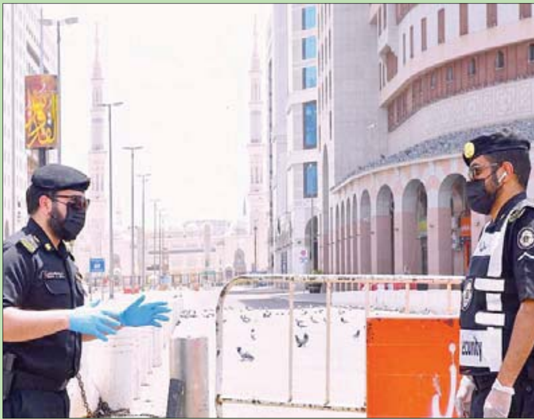
رجلا أمن يقومان بدورية قرب المسجد النبوي الشريف لغرض منع التجول أمس (واس)