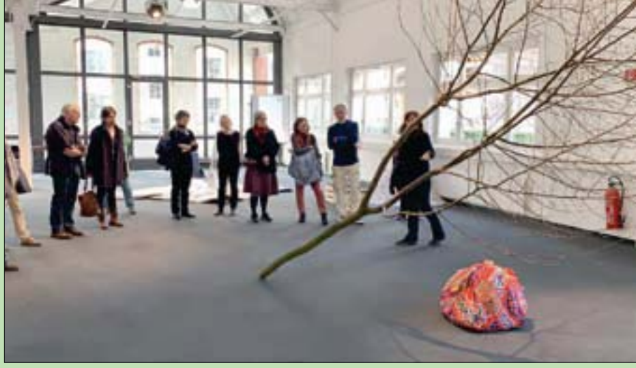
القاهرة، حمدي عابدين

من نبات البردي الذي كثر استخدامه في الحضارة الفرعونية، وفنون الخيامية التي تنتمي إلى التراث العربي الإسلامي، وورق صحف الجرائد، استلهمت الفنانة السويسرية باتريسا جاكوميل، أفكاراً متنوعة لتنفيذ أعمال تشكيلية وذلك بعد إقامتها بالقاهرة نحو 6 أشهر عبر منحة علمية سويسرية.