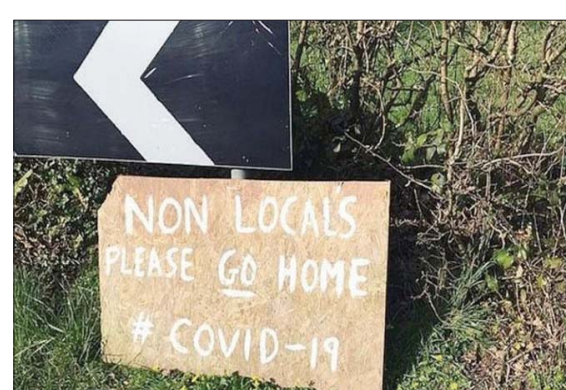
من اللافقات التي كتبها أهالي كورنول للقادمين من خارج المنطقة