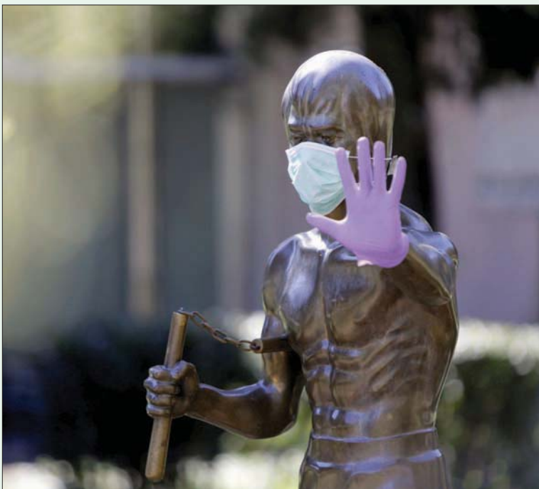
تمثال يصور شخصية بطل الفنون القتالية بروس لي المقام في مونتاز بالبوستة (أ.ب.)