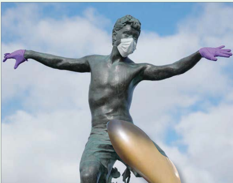
تمثال بكمامة وقفازات في كاليفورنيا