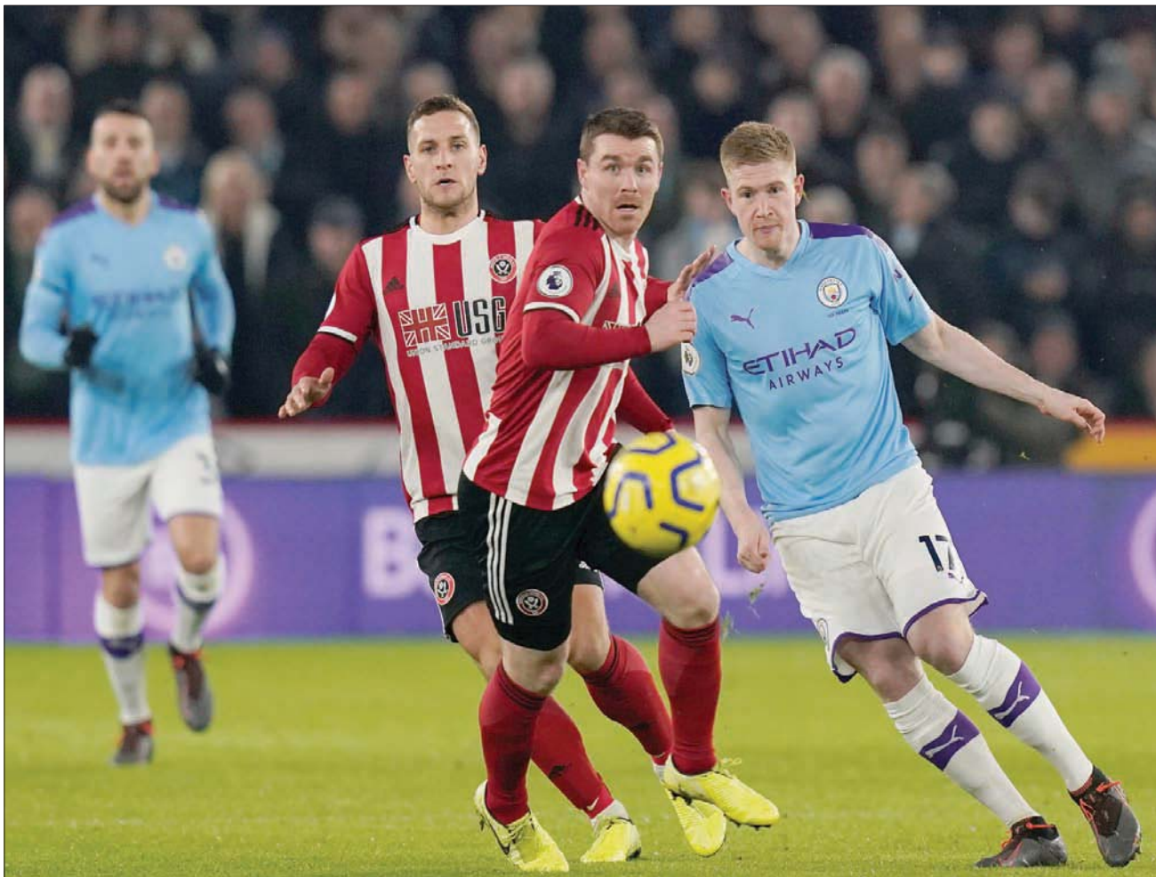
دي برون في طريقه لهنز شبك شيفيلد ونزادي في الدوري الإنجليزي

كان الوقت ليلة جمعة تحت أضواء معقل وولفرهامبتون «مولينجو»، وبدت الأجواء المحيطة ساحرة، وتكاد تأسر العقول، لكن هذا لم يكن ذمراً كافياً لإدراسون الذي تسبب في صدور قرار بطرده بعد 12 دقيقة فقط، من انطلاق المباراة بسبب اصطدامه بشدة بدوغو يوتا خارج منطقة الرمي. على الطرف المقابل، نجح روي باترسيسو في إنقاذ ركلة جزاء أطلقها رحيم ستريليغ، مرتين، بسبب تدخل تقنية «فار»، لكنه لم يتمكن من منع المهاجم من وضع مانشستر سيتي في المقدمة. وفي خضم مباراة اتسمت بمنافسة شديدة ومستوى رفيع من الأداء، نجح ستريليغ في ضمان تصدر مانشستر سيتي للمباراة بنتيجة 2-0. قبل نهاية المباراة، أهدى وولفرهامبتون واندرز بقوة وبحزن فوزاً تاريخياً بهدف التقدم الذي سجله مات دوهرتي في الدقيقة 89، لينتهي بذلك فعلياً مساعي مانشستر سيتي للاحتفاظ باللقب.