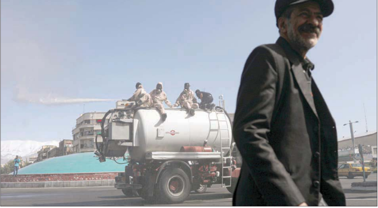
رجل يمشي بينما يقوم عناصر من الباسيج برش العقمات في شارع وسط طهران أمس