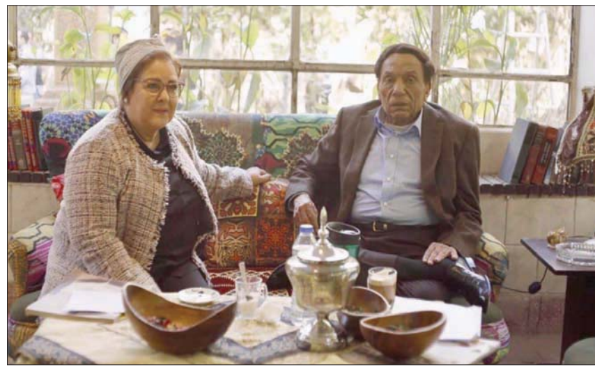
لقطة من مسلسل «فلانتينو» للفنان عادل إمام

يحافظ الفنان أمير كرامة على بريقه ونسب المشاهدة المرتفعة التي حققها على مدار المواسم الثلاثة الماضية، وفق محمود. ويغيب عن السباق الرمضاني المقبل عدد من النجوم الذين ارتبطوا برمضان، أبرزهم الفنان يحيى الفخراني وليلى علوي، وإلهام شاهين من جيل الكبار، بينما يغيب من جيل الشباب مصطفى شعبان لأول مرة منذ 8 سنوات، وعمر يوسف، الذي خرج من السباق الرمضاني للعام الثاني على التوالي، وكذلك حمادة هلال، وأحمد السقا، ومحمد إمام.