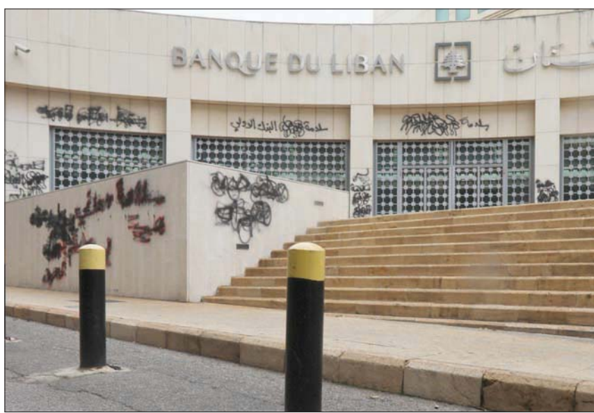
البنك المركزي اللبناني (رويترز)

ولاحظ المسؤول أن الاقتراح لا يعني إنشاء سوق ثالثة إلى جانب السوق الرسمية والسوق الموازية، إنما يحقق تيسيرا مرنا لتلبية الحاجات إلى السيولة النقدية بالليونة لحسابات الإيداعات بالدولار التي تحوز نسبة تتجاوز 77 في المائة من إجمالي الودائع في الجهاز المصرفي. كما يترقب أن تحد من تعريض احتياطيات البنك المركزي البالغة نحو 21 مليار دولار لاستنزاف سوقية محفز بمضاربات قد تدفع الدولار إلى سقوط أسوأ، وتنعكس فوراً على أسواق الاستثمارات التي تعاني من تضخم قارب متوسطه 60 في المائة خلال 4 أشهر، ووصل إلى 100 في المائة بما يخص أسعار السلع المستوردة ومواد التقويم والوازم الصحية المرتبطة بتدابير الوقاية ضد «فيروس كورونا».