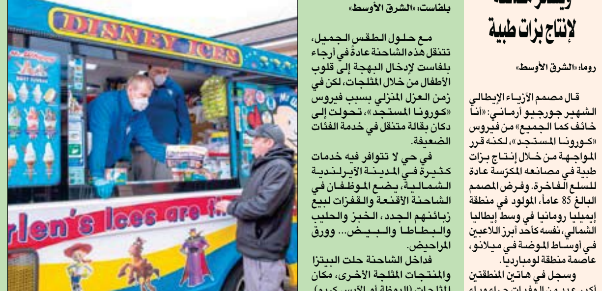
بلفاست، «الشرق الأوسط»، مع حلول الطقس الجميل، تتنقل هذه الشاحنة عادة في أرجاء بلفاست لإدخال البهجة إلى قلوب الأطفال من خلال المثلجات، لكن في زمن العزل المنزلي بسبب فيروس «كورونا المستجد»، تحولت إلى دكان بقالة متنقل في خدمة الفئات الضعيفة.