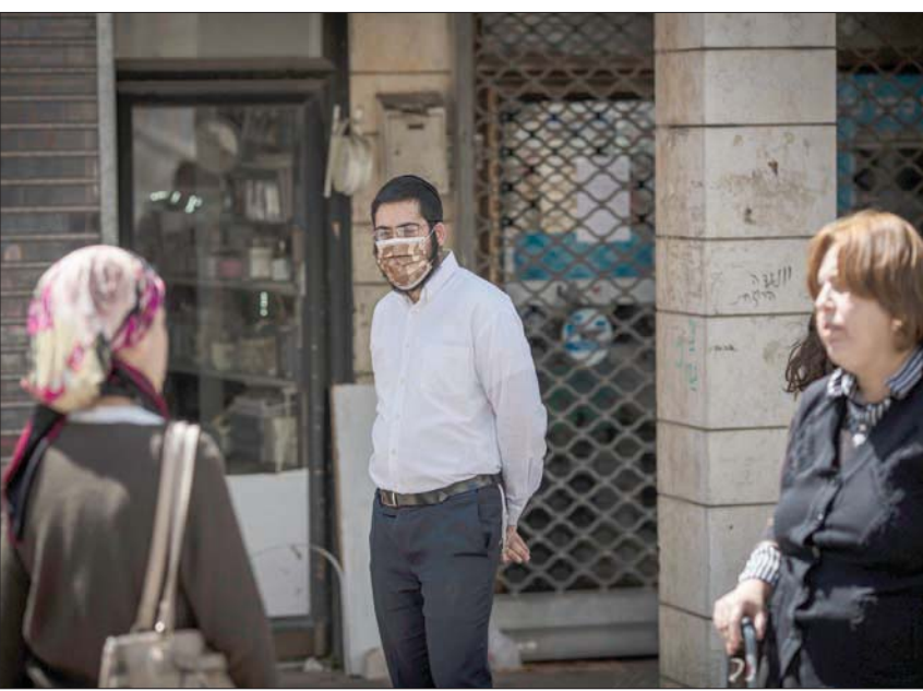
مواطنون يهود في مدينة بني براك التي تُعتبر بؤرة لتفشي فيروس كورونا في إسرائيل أمس الجمعة (د.ب.أ)

في غضون ذلك، كشف مصدر في وزارة الصحة الإسرائيلية، عن أن الأطباء في مستشفى «معاني يهشوعا» في بني براك، باشروا إجراء فحوصات كورونا. والدواء هو فيروس كورونا، الذي يستخدم حتى الآن لمعالجة المصابين بحمى النيل الغربي. ويتم تطبيق التجارب على 25 مريضاً بفيروس كورونا في هذا المستشفى، 8 منهم في حالة خطيرة وسيكون هؤلاء أول من يتناول هذا العقار التجريبي الذي يربح أن يعالج الالتهاب الذي يسببه فيروس كورونا في الرئتين، وهذه أول مرة يتم فيها تجربة هذا العقار في العالم لمعالجة «كورونا».