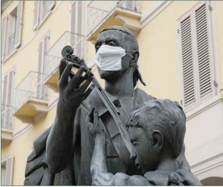
تمثال لصانع آلات الكمان أنطونيو ستراديفاري في مدينة كريمونا بشمال إيطاليا