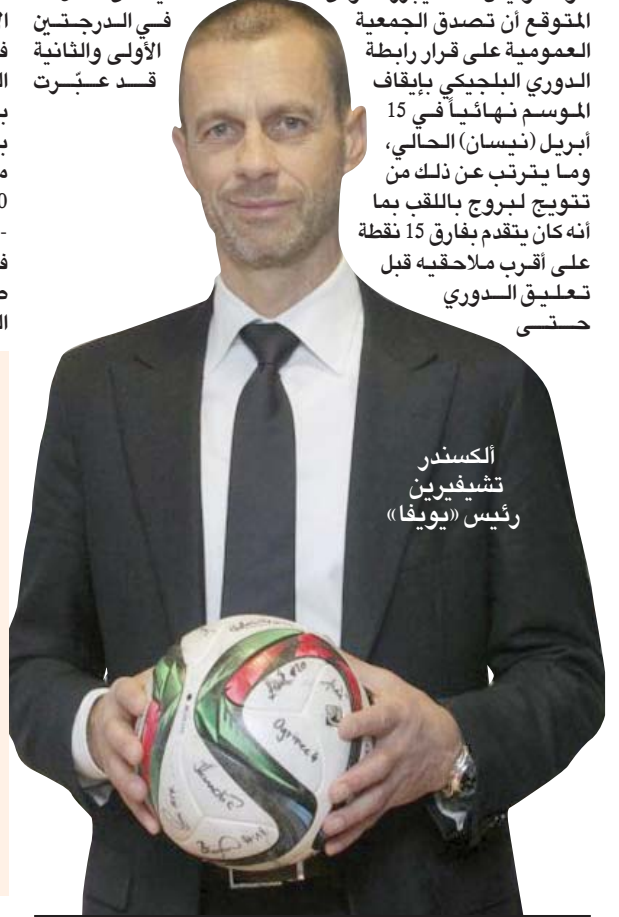
ألكسندر تشيفيرين رئيس «يويفا»

نهاية الشهر الحالي. وشهد الدوري إنهاء 29 مرحلة من أصل 30 ضمن الدوري المنتظم، قبل انطلاق فترة «الدوري أوف» والتي كان مقرراً أن يشارك فيها أول ستة أندية في الترتيب. ونتيجة الدور الفاصل، يتأهل صاحب المركز الأول إلى دور المجموعات من مسابقة دوري أبطال أوروبا، والوصيف إلى الدور التمهيدي الثالث من المسابقة القارية الأولى، والثالث إلى الدور الفاصل من الدوري الأوروبي «يوروبا ليغ». وقرر مجلس إدارة الرابطة الذي اجتمع عبر الفيديو، الخميس، بالإجماع أنه من غير المرغوب فيه، بصرف النظر عن السيناريو، متابعة المسابقة بعد 30 يونيو (حزيران)، وتضمن «عدم استئناف مسابقات موسم 2019 - 2020». وعلماً تم إلغاء الدور الفاصل «بلاي أوف» المقام بنظام الدوري المغصن. وكان 17 نادياً من أصل 24 في الدرجتين الأولى والثانية قد عثرت