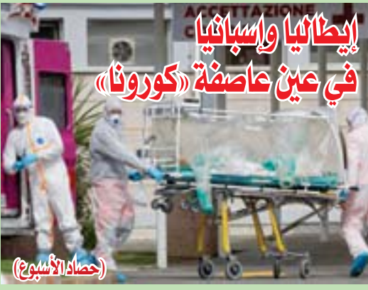
إيطاليا وإسبانيا في عين عاصفة «كورونا»