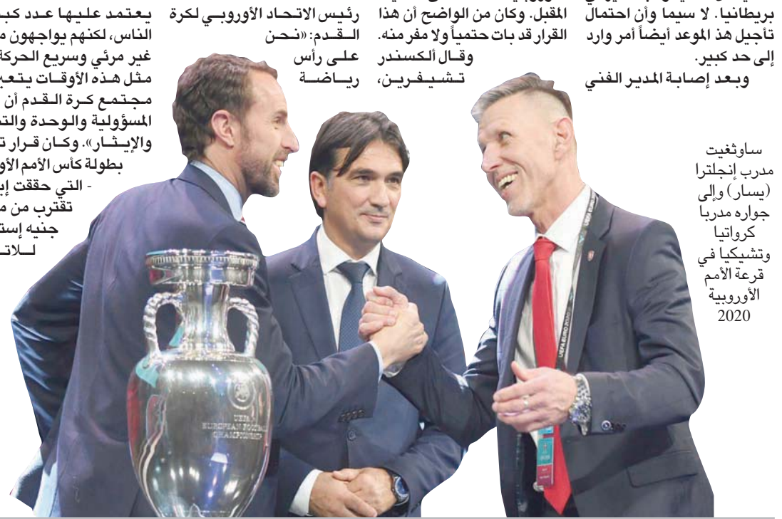
ساوثغيت مدرب إنجلترا (يسار) وإلى جواره مدربا كرواتيا وتشيكيا في قرعة الأمم الأوروبية 2020

وعندما تم الإعلان عن إصابة لاعب تشيلسي كالوم هودسون أودي بفيروس كوروننا، أعلن الاتحاد الأوروبي لكرة القدم الفور عن تأجيل جميع مباريات دوري أبطال أوروبا والدوري الأوروبي. وبعد مؤتمر فيديو طارئ ضم مسؤولين من الاتحاد الأوروبي لكرة القدم وممثلي جميع الاتحاد الوطنية في أوروبا والبالغ عددها 55 اتحاداً، تم الإعلان عن تأجيل كأس الأمم الأوروبية 2020 حتى الصيف المقبل. وكان من الواضح أن هذا القرار قد بات حتمياً ولا مفر منه. وقال الكسندر تشيفيرين،