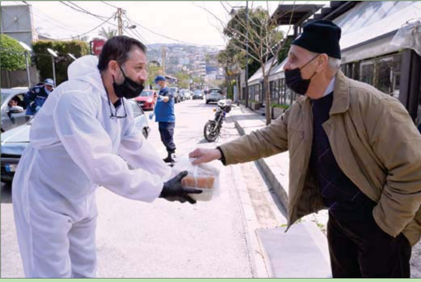
عواصم، «الشرق الأوسط»