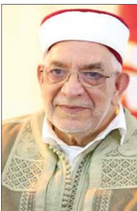
عبد الفتاح مورو

إلى الحكم شخصيات ومجموعات سياسية، لديها كتل برلمانية صغيرة، لا يمكن أن تضمن السير العادي لعمل البرلمان والحكومة وبقية مؤسسات الدولة»، بحسب تعبيره. ومع ذلك توقع مورو أن «تغير المشهد السياسي الحالي، المتأزم»، في أقرب وقت، وبمجرد انتهاء الصراع مع وباء «كورونا» المستجد.