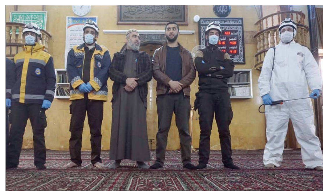
عناصر الدفاع المدني في مسجد في بنش بريف إدلب شمال سوريا (أغب)