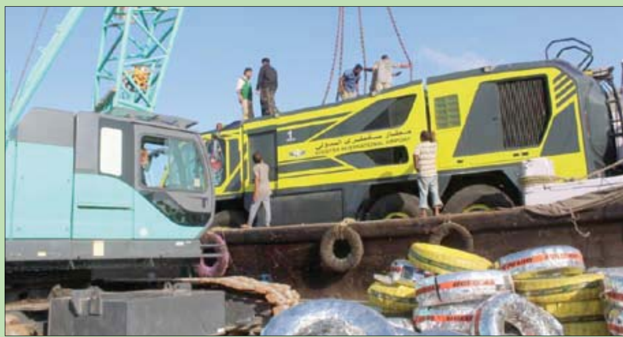
إحدى الآليات التي سلمها البرنامج السعودي لتنمية وإعمار اليمن في سقطرى

الشهري لمادة الدبزل لتشغيل المخضات المائية، بالإضافة إلى مشاريع شبكات مياه، ومشاريع إنشاء السدود المائية والجربك التجمعية للمياه، إلى جانب مشاريع إنشاء الخزانات المائية، ومشاريع حفر الآبار، ومشروع توفير صهاريج نقل المياه، والتي أسهمت في سد الاحتياج من المياه الصالحة للشرب، وتوفير مياه الري الجوانبي والزراعي.