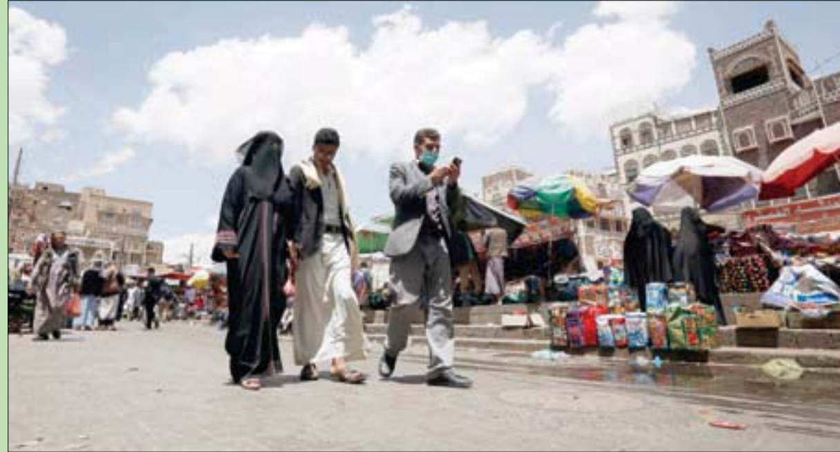
يمنيون يسيرون وسط صنعاء القديمة

وصاق الرئيس اليمني عبد ربه منصور هادي على اتفاقية اليونسكو الخاصة بحماية الآثار في مارس (آذار) من العام الماضي، بعد أن تم التوقيع على جميع ملحقاتها من قبل السفير اليمني السابق لدى اليونسكو.