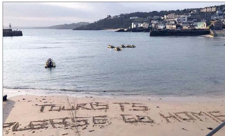
عبارات تطالب أهالي العاصمة بالعودة إلى ديارهم

الحكومة بورييس جونسون من الشعب البريطاني البقاء في المنازل، ولكن هناك شريحة كبيرة من سكان لندن لم تابه بالفعل لهذه التحذيرات، وانتقلت للعيش في الريف إلى أجل غير مسمى.