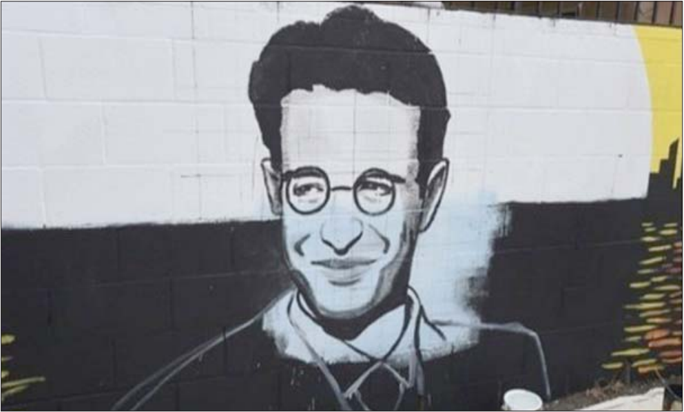
جدارية للصحافي دانيال بيرل في لوس أنجلوس عام 2015

أنها رحبت في المقابل بإمكان أن يلجأ المدعون الباكستانيون إلى الطعن في قرار المحكمة. وأشارت عملية قتل بيرل استنكاراً عالمياً في أوائل عام 2002، ما وضع الحكومة العسكرية الباكستانية تحت ضغوط كبيرة، في وقت كانت تحاول فيه تلميع صورتها بعدما دعت على مدى سنوات حركة «طالبان» المتشردة في أفغانستان المجاورة.