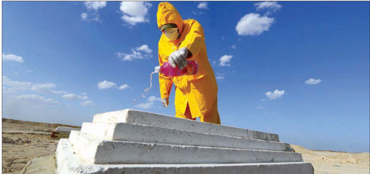
عراقي يصب مطهرًا أمس على قبر ضحية لفيروس «كورونا» في مقبرة تبعد 20 كيلومتراً عن النجف

الشعبي» على طريق مطار بغداد بغارة أميركية، وأائل شهر يناير (كانون الثاني) الماضي، قد تم رفع الخدمة عنه. وطبقاً لهذا القرار، فإنه في حال لم يتم تمرير كابينة الزرفي داخل البرلمان العراقي، فإن الكاظمي الذي بات يقبل به نصف «الفتح» مقابل رفض كل «الفتح» للزرفي سيعود مرشحاً للمصن من جديد. إلى ذلك، كشف نائب رئيس الوزراء الأسبق بهاء الأعرجي، عن «مفاوضات سرية» بين الزرفي وبعض الكتل المنضوية في التحالفات المعارضة لتكليفه بتشكيل الحكومة الجديدة. وقال الأعرجي، في تغريدة على «تويتر»، إن «بعض الكتل المنضوية في تحالفات معارضة للملك بتشكيل الحكومة، ترسل مفاوضات ثانوية له لمعرفة حصصها في الحكومة المقبلة، حال قيامها بتغيير موقفها منه». وأضاف الأعرجي: «وهنا نقول للملك، لا تلتفت لهم، لأن من لا يصون العهد مع خلفائه، لا يمكن أن يستمر معهم».