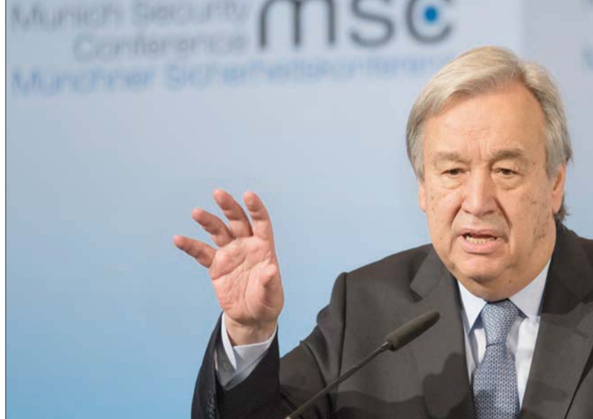
الأمين العام للأمم المتحدة أنطونيو غوتيريش

جند الأمين العام للأمم المتحدة أنطونيو غوتيريش نداءه لوقف النار في كل أنحاء العالم، محذراً من أن «الأسوأ لم يات بعد» في مناطق النزاع. وألحظ أنه رغم إعلان الحكومة اليمنية المعترف بها دولياً ومليشيا الحوثي العمدة من إيران التزامهما، تصاعدت الأعمال العدائية في اليمن. وأكد حث على وقف شامل للقتال والحرب في سوريا وليبيا وغيرها من الحروب، من أجل التفرغ لما سماه «المعركة المشتركة» ضد وباء «كوفيد-19».