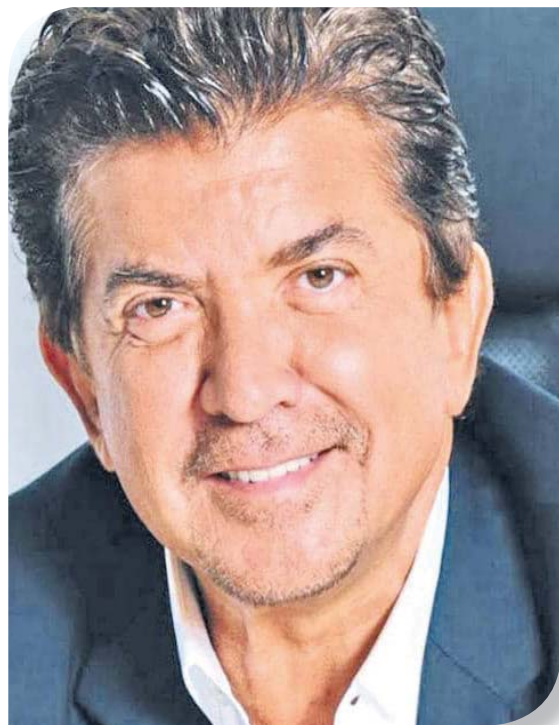
ينوي الفنان وليد توفيق التجول في لبنان من شمالي إلى جنوبيه عند انتهاء كارثة «كورونا»

الحلقة الأولى من إعلان خبر وباء «كورونا» في الصين. وكان لدي إحساس دفين بضرورة عودتي إلى بيتي وأهلي وهكذا حصل». وهل أقممت مع نفسك وقفة حياة راجعت فيها حساباتك؟ يرد صاحب لقب «النجم العربي» «أنا من نوع الأشخاص الذين يراجعون حساباتهم باستمرار فلا تمر ليلة علي من دون أن أسترجع كل ما علي وما فعلته. وهذا الأمر أمارسه في مهنتي وانتقد نفسي بقسوة مرات وأحاول عدم الوقوع في مطبات وأخطاء سبق ووقعت بها. وفي هذه القعدة الطويلة