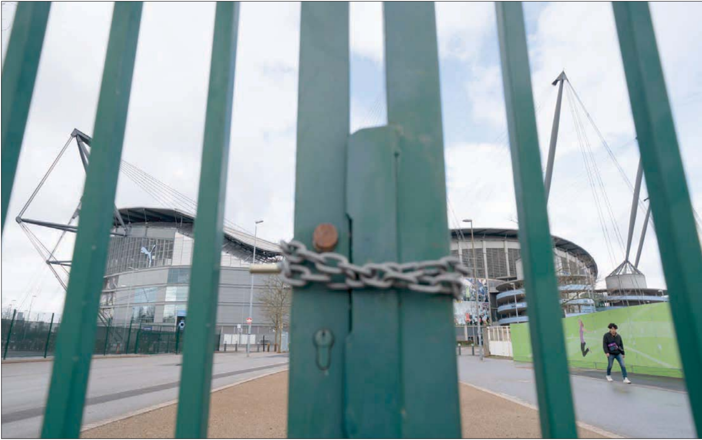
بوابات ملعب مانشستر سيتي المغلقة تنطق مثل مثيلاتها في الأندية الأخرى بأزمة الكرة الإنجليزية

بما سيحدث في هذا الأمر، لكن عندما تعود الحياة إلى طبيعتها في نهاية المطاف، سيكون هناك تحد هائل فيما يتعلق بكيفية إنهاء المئات من مباريات الدوري والكأس في مباريات دوري أبطال أوروبا والدوري الأوروبي. إن «الالتزام باستكمال جميع مسابقات الأندية المحلية والأوروبية بنهاية الموسم الرياضي الحالي، الذي 30 يونيو (حزيران)»، الذي وقع عليه الاتحاد الأوروبي لكرة القدم ومعظم الدوريات المحلية في أوروبا، قد يعني أيضاً أنه ستكون هناك «قيود محتملة أو عدم التزام بالتقويم المتبع، وهو ما سيؤدي إلى إقامة مباريات في الدوريات المحلية في منتصف الأسبوع، وتغيير مواعيد مباريات الأندية في المسابقات الأوروبية لتتواءم في نهاية الأسبوع».