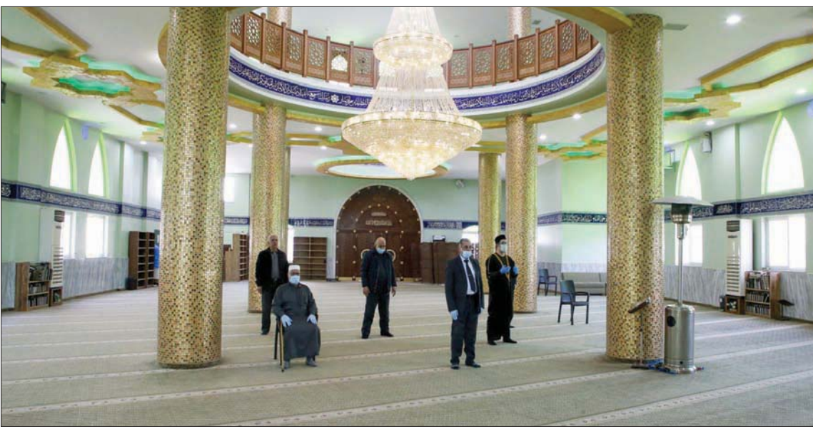
أفراد من الوقف الفلسطيني خلال صلاة الجمعة في مسجد السلام المغلق بمدينة الخليل في الضفة الغربية أمس (أ.ف.ب)

نقلهم لمراكز الحجر الصحي، مشيراً إلى أنه تم إجراء أكثر من 1500 عينة فحص. وأشار لمح إلى أن أعداد المصابين بـ«كورونا» ارتفع إلى 171 إصابة في فلسطين حتى صباح أمس. وأكد أن جميع المصابين حالتهم مستقرة في مختلف المدن.