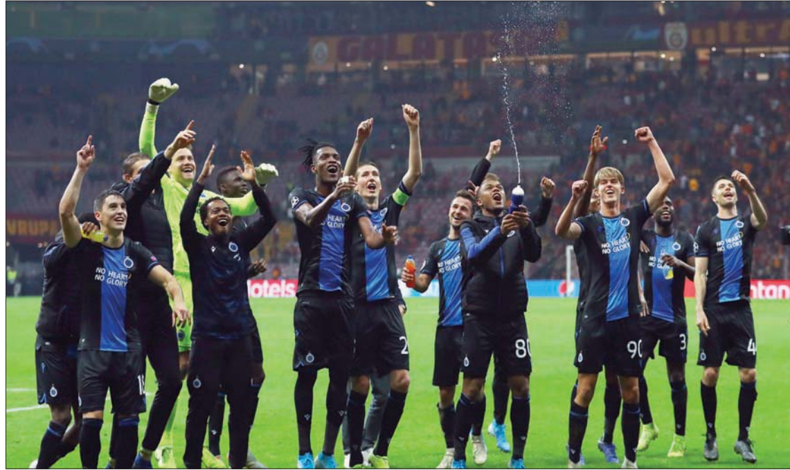
تتويج بروج بلقب الدوري البلجيكي دفع «يويفا» إلى تهديد الدوريات الأخرى

التعميد». كما حث الخطاب على تعاون بطولات الدوري في أوروبا معاً. وأضاف: «فقط التعاون الاستثنائي بين منظمي جميع البطولات يمكن أن يسهم في خروج كرة القدم الأوروبية من الأزمة واستعادة أصولها وبتولياتها». ويتخوف من أن تمهد بلجيكا بالقرار في حال تم التصديق عليه من الجمعية العمومية منتصف الشهر الحالي، الطريق أمام البطولات الأوروبية الأخرى للسير على هذه الخطى، لا سيما في إيطاليا وإنجلترا حيث هناك مطالبة بإنهاء الموسم في ظل ارتفاع حالات الوفيات والإصابات بفيروس «كوفيد - 19». ورأى السيدان المشترك الصادر عن الاتحاد الأوروبي وربطتي الأندية الأوروبية والأهمية القصوى... منح النتائج... يجب أن نضمن ذلك ما دامت هناك فرصة أخيرة قائمة، وما دامت هناك إمكانية لإيجاد حلول للبروزنامة والعمليات والقوانين».