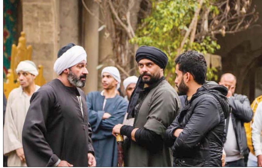
لقطة من مسلسل «الفتوة» لياسر جلال