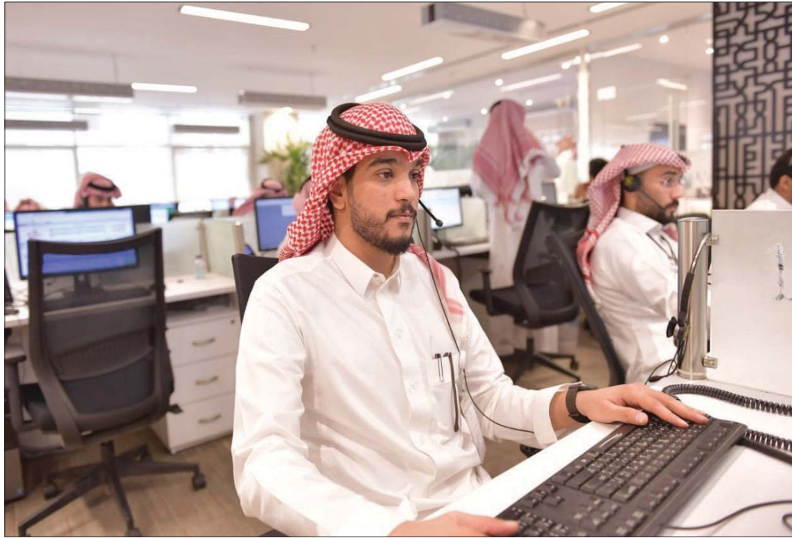
السعودية تعزز استقرار الموارد البشرية الوطنية في القطاع الخاص