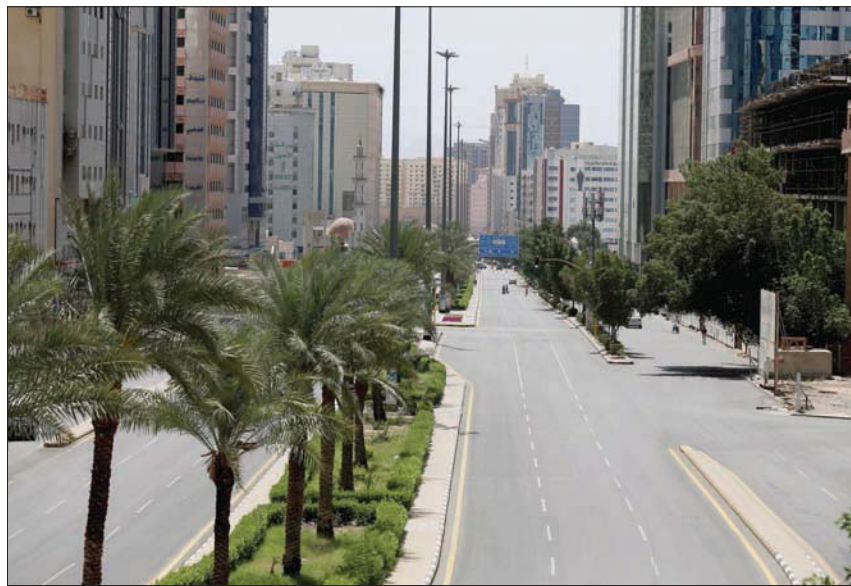
شوارع مكة المكرمة بدت خالية من التدفق البشري الذي كانت تشهده قبل فرض الحظر الذي التزم به السكان

وأشترط الأمر الملكي أن تلتزم المنشآت باستئناف دفع أجور العاملين للمستفيدين لديها وفق الأمر الملكي، فور توقف التعويض، كما تلتزم المنشأة بالاستمرار