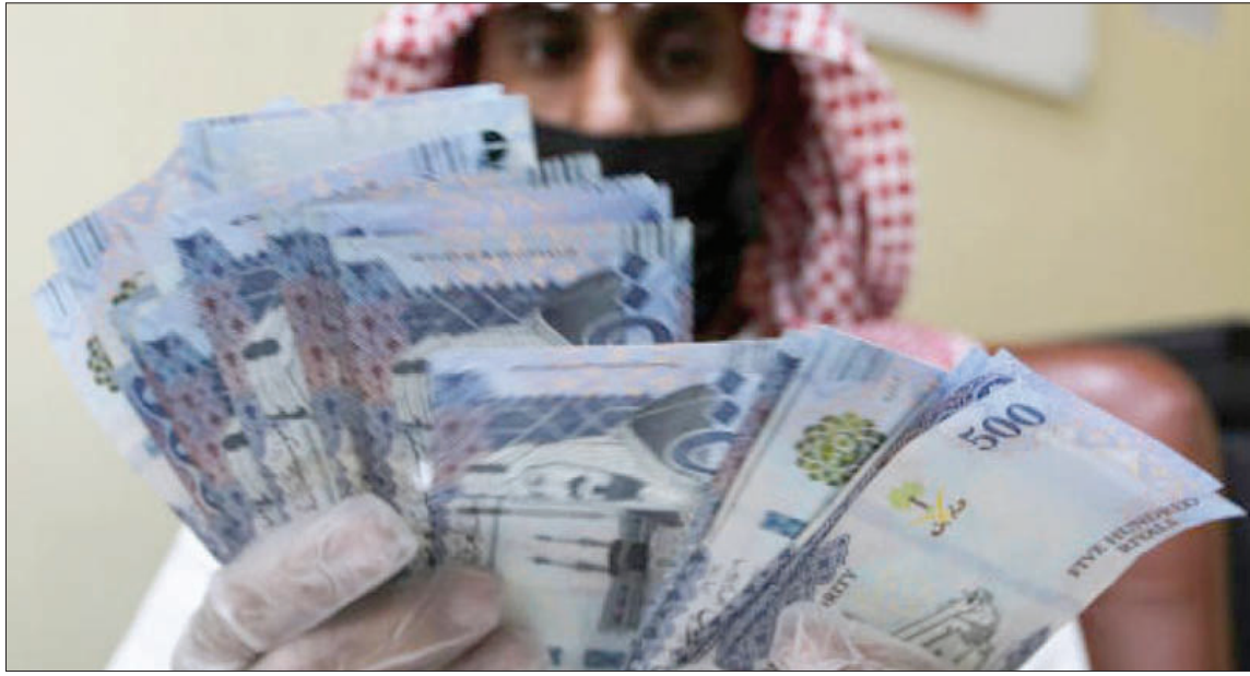
«كورونا» سيسهم في تعزيز التعاملات المالية غير النقدية في السعودية

وكانت سياسات محفزة قامت عليها «مؤسسة النقد» مؤخراً لتشجيع استخدام التقنيات الأمنة للدفع، من بينها رفع سقف الأعلى لتفعيل عميات الدفع الإلكتروني عبر تقنية الاتصال قريب المدى، وكذلك فتح الدفع عبر نظام الشبكة السعودية للمدفوعات «مدى» مباشرة في مبيعات الإنترنت، بالإضافة إلى التنسيق لإكمال العمل مع شركات الدفع العالمية لإتاحة قبول الدفع عن بعد.