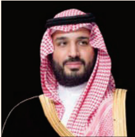
الرياض، «الشرق الأوسط»

تلقي الأمير محمد بن سلمان، ولي العهد نائب رئيس مجلس الوزراء وزير الدفاع السعودي، اتصالاً هاتفياً من رئيس كوريا الجنوبية، مون جاي إن.