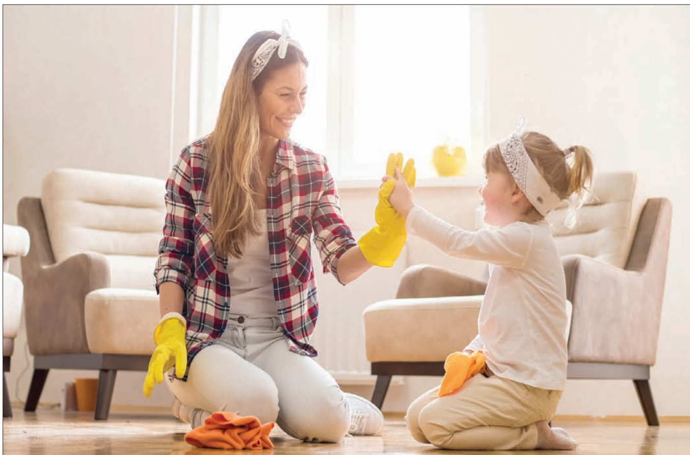
استغل فترة الحجر لتنظيف المنزل وترتيب مع أفراد العائلة