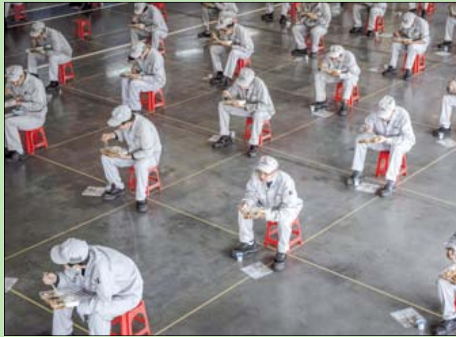
عمال خلال استراحة الغداء في مصنع سيارات بمدينة وهان الصينية بؤرة تفجر فيروس «كورونا» حيث بدأت الحياة في العودة إلى طبيعتها تدريجياً