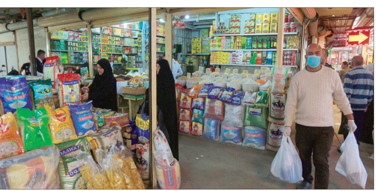
متسوقون في سوق شعبية ببغداد

بمساعدته فنياً والتحول من الارتباط الصلب إلى المرحلة المرنة نتيجة ازدياد قدرات القوات المسلحة العراقية، ولذلك هي خرجت من قاعدة (القائم) العراقية، وقد تنسحب بعينها من قاعدة (التقدم) العراقية، وربما يحدث في أماكن أخرى حيث تجري فاهاتنا بهذا الشأن».