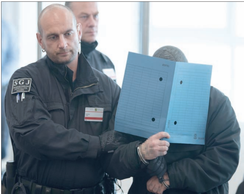
محاكمة إرهابي من اليمين المتطرف في دريسدن بألمانيا العام الماضي

وفي السنوات الماضية، تزايدت الاعتداءات اليمينية المتطرفة ضد اللاجئين ومؤيديهم من السياسيين والناشطين في المجتمع المدني، ويتهم نشطاء الساحل الأفريقي. وجرى إنشاء هذه الاعتداءات جديدة وبالتكؤ في لاحقة مرتبعتها. وقد شكّلت وزارة الداخلية وحدة خاصة لمكافحة جرائم اليمين المتطرف، وفي العاصمة برلين خصصت الشرطة كذلك فريقاً لمسارات مشتبه بهم بإنشاء مسارات الكثير من السياسيين اليساريين والناشطين مع اللاجئين الذي تعرضوا لاعتداءات في السنوات الماضية، منهم حتى من أحرق منزله، من دون أن تتوصل الشرطة إلى أي مشتبه بهم. والنشطاء نفسها لفتها فضائح في عدد من الولايات بسبب اختراقها من قبل اليمين المتطرف. ويخترق اليمين المتطرف كذلك الجيش الألماني.