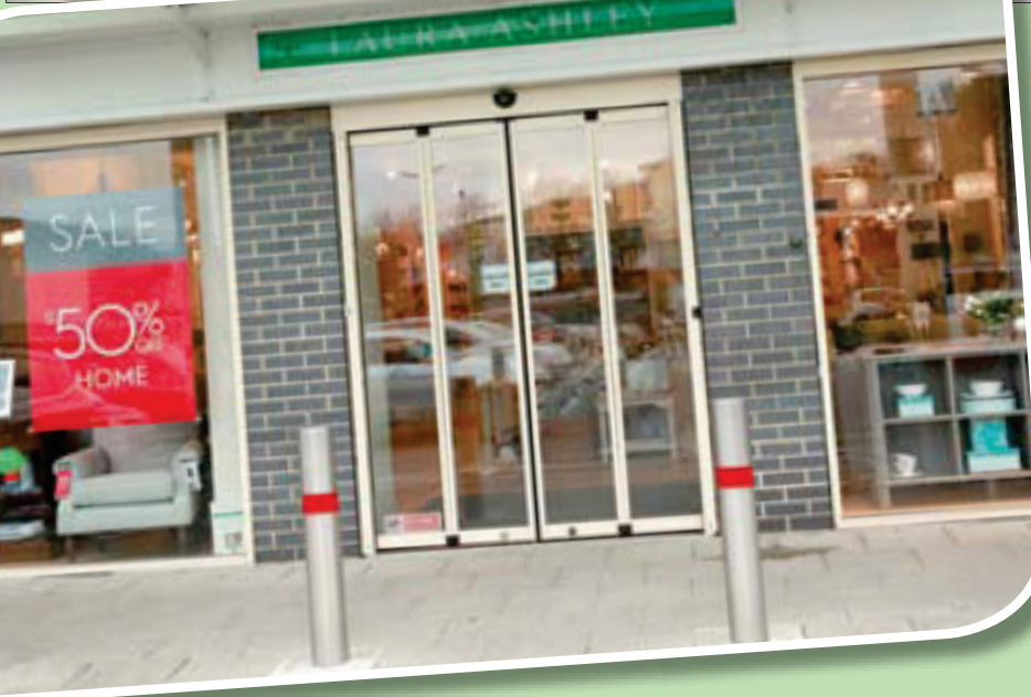
اضطرت شركات أزياء كبيرة إلى إغلاق محلاتها بينما أفلتت شركات أخرى

العصيبة قد يكون آخر شيء يخطر على البال، فإنه لا أحد يُنكر أهمية قطع الثياب في إدخال السعادة والراحة على النفوس. وتضيف أنّ مشكلة العمل من البيت هي التعود على قطع معينة لا غيرها إلى حد أنها نسيبتنا بالمثل وتؤثر على نفسيتنا من دون أن نشعر. وتستدل على هذا بتجارب صديقات لها يعملن من بيوتهن حتى قبل جائحة كورونا، فتقول: «إنهن يتكاسلن ويهملهن مظهرهن إلا في حال استقبال أحد أو اضطرابهن للخروج، وهو ما ليس وارداً حالياً في ظل الحجر الصحي»، خبراء موضة