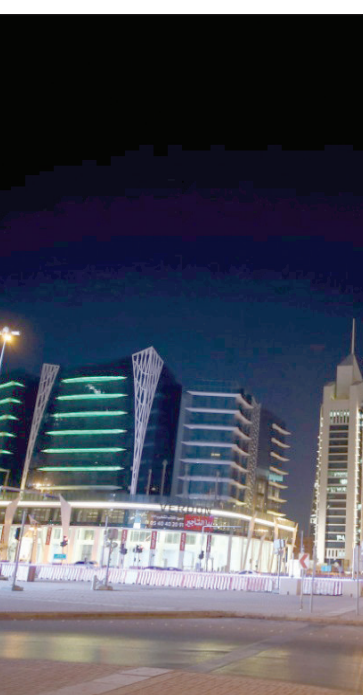
أحد شوارع الرياض كما بدأ أول أيام منع التجول

مغلقة. انعطفت يميناً من طريق الإمام سعود، باتجاه الشرق، كانت الأنفاق خالية، موحية أحياناً. كم مرة شتمت الزحام، ولعنت السائقين المتهورين، واليوم أقود سيارتي وحيداً، واستنخاء سياراتي أو ثلاثاً حتى أجد موقفاً شاغراً. هذه المرة وقفت بشكل طولي. لحسن جوني الغليبي من خلف الزجاج، أشار بإبهامه نحوي، فقد اعتاد ظلي منذ سنوات، ثم