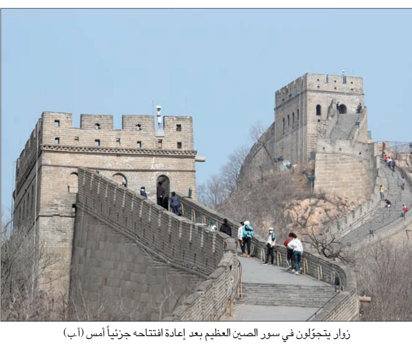
زوار يتجولون في سور الصين العظيم بعد إعادة افتتاحه جزئياً أمس (أب)

بمزيد من المساعدات المالية لالشركات والعائلات التي فقدت مصادر رزقها، وشددت على ضرورة تكليف الجيش وقف النزوح نحو المقاطعات الجنوبية التي ما زالت نسبة الإصابات فيها متدنية، كما طلبت تجربة جميع الأدوية التي كانت لها نتائج إيجابية في علاجها استخدمتها دول أخرى. وفيما أفادت السلطات أنها اعترضت شحنة من أجهزة التنفس كانت معدة للتصدير من ميلانو إلى اليونان، قال الناطق بلسان وزارة الصحة إن ألمانيا ستترسل شحنة من أجهزة التنفس ومعدات الوقاية إلى إيطاليا قبل نهاية هذا الأسبوع، وذلك بعد وصول شحنات مماثلة من الصين وروسيا أواخر الأسبوع الفائت. وبينما يركز الخبراء اهتمامهم على الحالة الألمانية حيث لم تسجل حتى الآن سوى 86 حالة وفاة، رغم عدد الإصابات الذي تجاوز 23 ألفاً، حذرت المفوضية الأوروبية من تداعيات بؤرة الانتشار التي كُشف عنها في محطة «إيشغيل» للتزجج في النمسا، والتي يخشى أن تتحول إلى مركز انتشار الوباء في الشمال الأوروبي. وكانت أيسلندا قد حذرت من هذا الخطر مطلع هذا الشهر عندما رصدت عدة إصابات بين مسافرين قادمين من هذا المنتجع الشتوي الذي لم يقفل أبوابه حتى الرابع عشر من الشهر الحالي. كما أن ألمانيا والدنمارك والنرويج قد رصدت ما لا يقل عن 500 إصابة لمسافرين وأقاربين من تلك القرية نفسها التي لا يزيد عدد سكانها عن 1600، وتستقبل سنوياً أكثر من نصف مليون سائح.