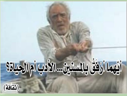
أيهما أرفق بالمستين... الأدب أم الحياة؟ (ثقافة)

شويغو نقل «رسالة حازمة» للأسد حول إدلب... وأنقرة ترفع إلى 50 عدد نقاطها