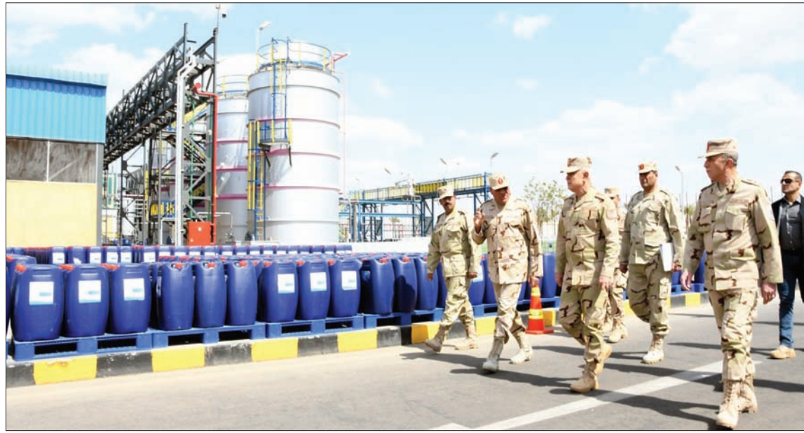
رئيس الأركان المصري يتفقد مواد التعقيم قبل ضخها بالأسواق

القاهرة، محمد نبيل حلمي كثفت مصر من إجراءاتها الاحترازية لمواجهة فيروس «كورونا المستجد»، وقررت الحكومة «حظر الانتقال في أنحاء البلاد كافة بداية من اليوم من الساعة مساءً وحتى السادسة صباحاً لمدة أسبوعين»، وفيما دعا رئيس مجلس الوزراء مصطفى مدبولي المواطنين للانضمام بالتدابير الجديدة، فإنه توعد المخالفين بـ«العقوبات الواردة بقانون الطوارئ على المخالفين سواء بالسجن أو الغرامة». وخلال اجتماع حكومي، أمس، أعلن مدبولي، عن تفاصيل الإجراءات الجديدة، والتي استقبلها الرئيس المصري عبد الفتاح السيسي، بتصريحات عبر حساباته الرسمية الموثقة على مواقع التواصل الاجتماعي، قال فيها إنه «كف الحكومة والأجهزة التنفيذية بتطوير الإجراءات الاحترازية المتبعة بما يسهم في تحقيق أعلى معدلات الأمان، وبما لا يؤثر على متطلبات الحياة اليومية للمواطن المصري». وأفاد مدبولي، بأن التدابير الجديدة تتضمن «حظر التنحر على جميع الطرق، وتوقف جميع وسائل النقل الجماعي العامة والخاصة من الساعة مساءً وحتى السادسة صباحاً»، فيما تقرر كذلك إغلاق «المحال التجارية والحرفية بما فيها محال بيع السلع وتقديم الخدمات والمراكز التجارية (المولات) بداية من الخامسة مساءً طوال أيام الأسبوع، عدا يومي الجمعة والسبت، اللذين تقرر أن يكون الإغلاق خلالها بشكل كامل على مدار الـ 24 ساعة، مع استثناء الصيدليات والمخابز على أن تستمر المستشفيات والمراكز