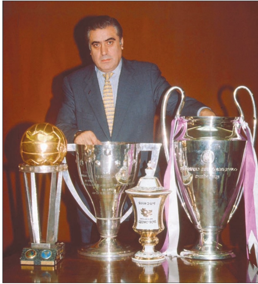
لورينزو سانز له الفضل في إعادة ريال مدريد للبطولات الأوروبية بعد سنوات من الخوف

وإذ نظرتنا إلى تشكيلته الفريق، سنجد أن 3 لاعبين فقط -راؤول وريدوندو وروبرتو كارلوس- هم من كانوا في تشكيلته الفريق في البطولتين. وبعد رحيل كابيلو، تعاقد سانز مع هاينكس، لكن المدير الفني الألماني أقبل من منصبه بعد أسبوع واحد فقط من فوزه بلقب دوري أبطال أوروبا. وكان ريال مدريد في ذلك الوقت يملك