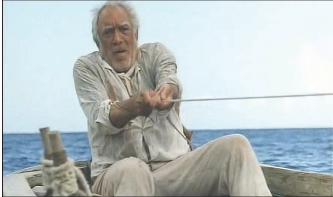
مشهد من فيلم «الشيخ والبحر» 1958

الأرض واستشراء أوبختها. وفي «ذاكرة غانباتي الحزبنات» لا يتردد ماركيز في جعل بطله التسعيني يقع في غرام مراهقة دون العشرين، كطريقة وحيدة لمراوغه الموت وتضليله. لكن المسألة هي بخلاف ذلك في نظر الياباني ياسوناري كاواباتا، الذي يرسم في رائحته الروائية «الجماليات النائمات» صورة أكثر قمامة من حال الإنسان في المأساة تلك التي أنشأها في بعضه للمسنين عن العجائز محدد، يتأمل الشباب العربيات والمنموذج بفعل التخدير، ليس سوى طريقة كاواباتا المتبكرة لثناء الحياة الألفية، بعد أن فقد أصحابها أهلية المشاركة في صنعها أو تذوق ثمارها. ولأن قوانين النزل لم تكن لتسمح للمسنين باكثر من الملامسة العابرة للأجسام المومنة، بغية استرجاع فرايدس الماضي، فإن تخطي تلك القوانين الصارمة من قبل الكهل إيفوشي، كان كافيًا لنسف التجربة من أساسها وتحويلها إلى مسرح كابوسي ودموي.