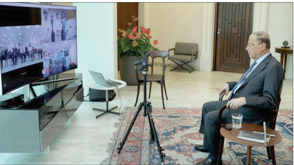
الرئيس ميشال عون يتابع اتصالاته أمس عبر الفيديو (الآلاتي ونهرا)

موسكو، رائد جبر كان وزير الدفاع الروسي سيرغي شويغو مضطراً للخضوع إلى فحص «كورونا» فور عودته من سوريا ولقاءه الرئيس بشار الأسد في دمشق. زيارة مفاجئة في توقيتها ومستواها، وفي الملباسات التي رافقتها، مثل تعمد وزارة الدفاع أن طائرة الوزير رافقتها مقننات من طراز «سوخوي 35» لحمايتها. وهنا حملت الزيارة رسالتها الأولى، إلى الأميركيين والإسرائيليين، كما للأطراف الأخرى بما في ذلك دمشق. ذهب شويغو محاطاً بهذه الهالة، إلى العاصمة السورية في «زيارة عمل» كما وصفتها موسكو، لمقابلة الأسد، لنقل أفكار أو رؤى لم يكن من المناسب إرسالها على مستوى أقل. وقال بيان وزارة الدفاع إن الوزير بحث مع الرئيس السوري اتفاق الهدنة في إدلب، والبيات تنفيذ الاتفاق الروسي - التركي، والوضع في شمال شرقي البلاد. وكان الاستنتاج الأبرز أن الرجل المسؤول بشكل مباشر عن الوضع في سوريا حمل في خفيه تلويع حازمة من الكرملين، بأنه لن يكون مسموحاً تجاوز الاتفاقيات الروسية مع أنقرة، أو محاولة تعريضها للخطر. جاء هذا على خلفية تلويع دمشق أخيراً، باحتمال استئناف القتال لاستكمال السيطرة على طريق حلب - اللاذقية. موسكو لا تريد «استفزازاً»