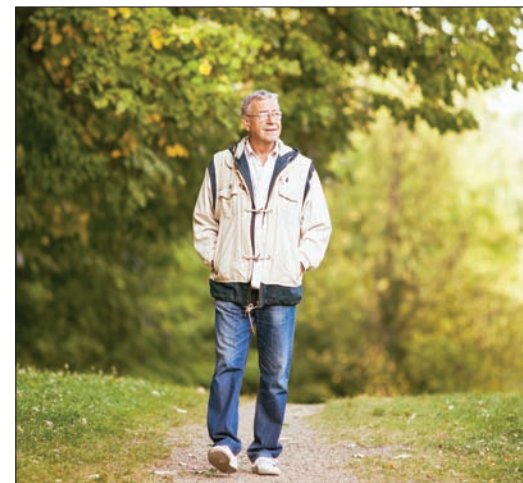
الرياض في الحدائق له فائدة صحية ونفسية

مفيدة في هذه الفترة، فمقدمو البرامج التلفزيونية هم أيضاً يعملون من بيوتهم ويقومون بتقديم برامجهم عبر «سكايب». إذا كنت تقم في بلد لا يسمح بترك المنزل على الإطلاق، استغل الوقت في ترتيب الخزائن والتخلص من الثياب التي مر عليها عام أو أكثر من دون أن تستخدم، وبعدها قم بالتنظيف المنزلي الشامل. فقد ثبت علمياً أن القيام بالأعمال المنزلية يساعد في المحافظة على لياقة الجسم وصحة العقل ويؤدي إلى الراحة النفسية. كما أن النظافة من حولنا يوصي بها في ظل تفشي