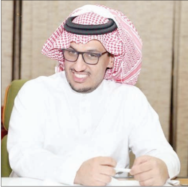
حاتم المسحل (الشرق الأوسط)

وخضع الفونس هورمان، رئيس الاتحاد الألماني للرياضات الأولمبية، للحجر الصحي الفردي بمنزله إثر اكتشاف إصابة نجله بفيروس «كورونا» المستجد. وأكد هورمان: «ظهرت نتيجة فحص نجلي الأكبر إيجابية، ونظراً لحظاتي له قبل أسبوع واحد، دخلت الآن في العزل الصحي الاحترازي حتى يوم 30 مارس الحالي». وأكد هورمان أن القيود المفروضة عليه في العزل الصحي لن تؤثر على إدارة وتشغيل الاتحاد الألماني للرياضات الأولمبية حيث يستطيع العمل من المنزل (مثل كثيرين في ألمانيا حالياً)، مشيراً إلى أن نائبته فيرونكا روكر ستكون في مقر الاتحاد.