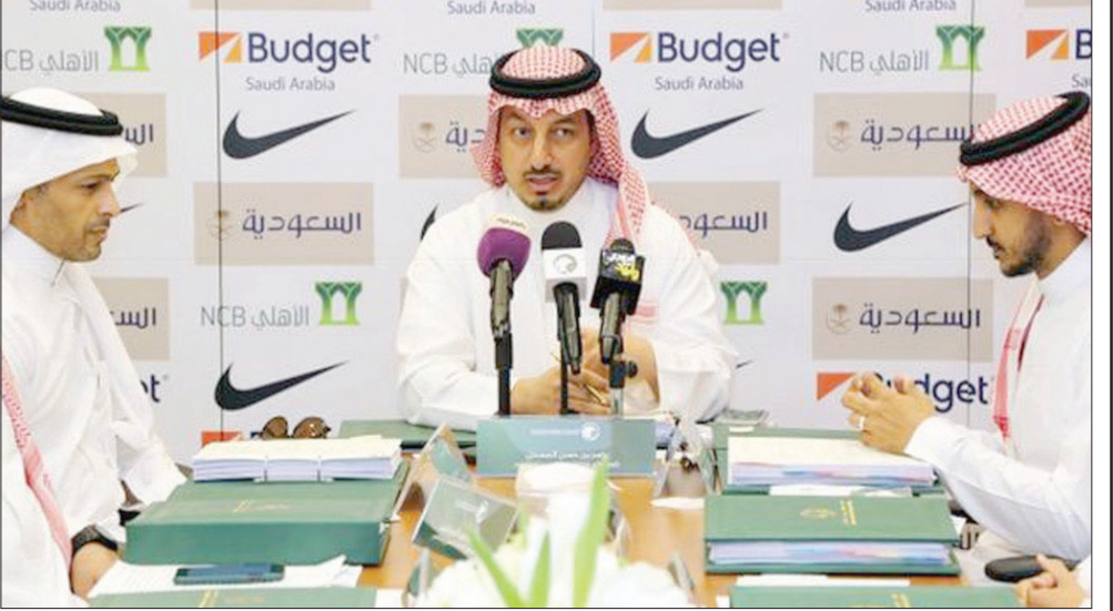
من اجتماع سابق للاتحاد السعودي لكرة القدم