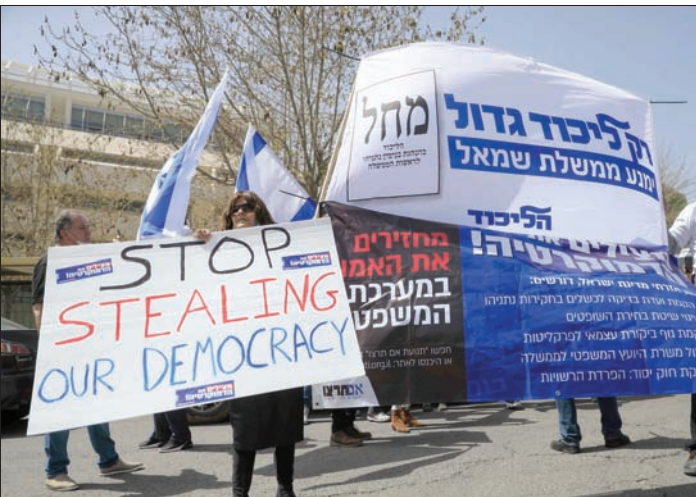
مؤيدون لانتتياهو تجمعوا أمس رداً على مظاهرة مناهضة له أمم الكنيست

لغان» لرئاسة الكنيست وأخر لرئاسة لجنة الخارجية والأمن، فيما تولى مندوب عن ليرمان لجنة المالية، وتولى مندوبان عن القائمة المشتركة رئاسة لجنة الشؤون الاجتماعية ولجنة مكافحة العنف والجريمة. وقد هاجم اليمين تسليم القائمة المشتركة رئاسة لجنة الشؤون الخارجية، وتدعى أنه يعني «توكيل ممثل عن حزب يدعم الإرهاب مسؤولية مشوهي الحرب والعلاقات الثكلى من ضحايا الإرهاب». فاعتبرها وزير القضاء السابقة، أيليت شكين، إن «هذا القرار يدل على إفلاس حزب (كحول لغان) قيمياً وأخلاقياً».