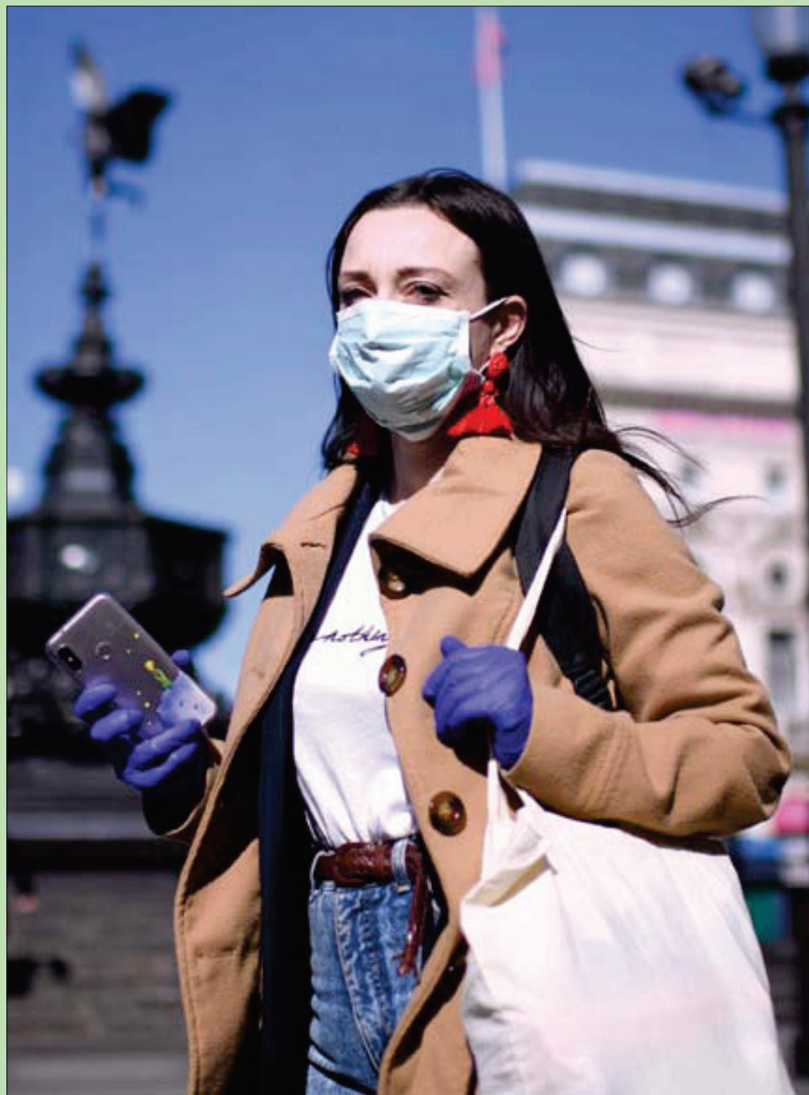
بريطانية ترتدي كمامة في وسط لندن أمس بعدما أغلقت الحكومة العاصمة لإبطاء انتشار فيروس «كورونا» (أ.ف.ب)

لا جدال في شريعة وأهمية التدابير الاحترازية الحالية، لأنه كما يقال في الأمثال العامية القديمة: «يا روح ما بعدك روح»، خاصة أن صون أحيانا ممن هم أكثر عرضة لهجوم «كورونا» المدصر، هو مهمة المهمات، لكن أيضاً على القلب الآخر، كيف تصان أعمال مئات الملايين من البشر على كامل الكوكب الأرضي الذين يعولون أنفسهم وأسرهم؟ ذاك هو التحدي الأكبر والأخطر والذي لا سابق له.