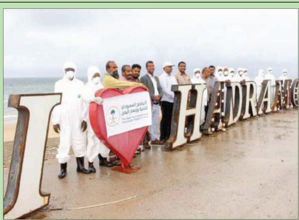
مشاركون في حملة تعقيم حضرموت (البرنامج السعودي لتنمية وإعمار اليمن)

وكانت مصادر رسمية حكومية أفادت بأن «الميليشيات الحوثية احتجزت سفينة الأمم المتحدة التي ترسو في ميناء الحديدة وعلى متنها بعثة الأمم المتحدة إلى اليمن ومنعتها من المغادرة للمرة الثانية».