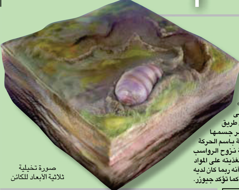
صورة تخيلية ثلاثية الأبعاد للمكانن

المواد العضوية؛ مما يشير إلى القدرات الحسية البدائية». وتحافظ الجحور أيضاً على شكل «V» عرضية؛ مما يشير إلى أن هذا المكانن تحرك عن طريق تقلص العضلات عبر جسمها مثل الدودة، والمعروفة باسم الحركة التمعية، وتشير أدلة الرواسب في الجحور وعلامات تغذيتها على المواد العضوية المدفونة، إلى أنه ربما كان لديه فم وفتحة شرج وأمعاء، كما تؤكد جيورز.