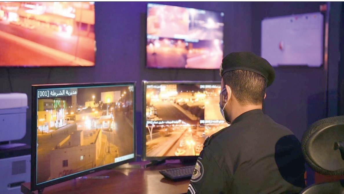
رصد أمني عبر الكاميرات في المدن السعودية

في مقفي فيديو، يظهر محتواه تصويرهم لخرقهم أمر منع التجول والتباهي به، لانطوائها على إنتاج ما من شأنه المساس بالنظام العام، وإذكاء روح التحريض الأثم، والتقليل من جهود رجال الأمن.