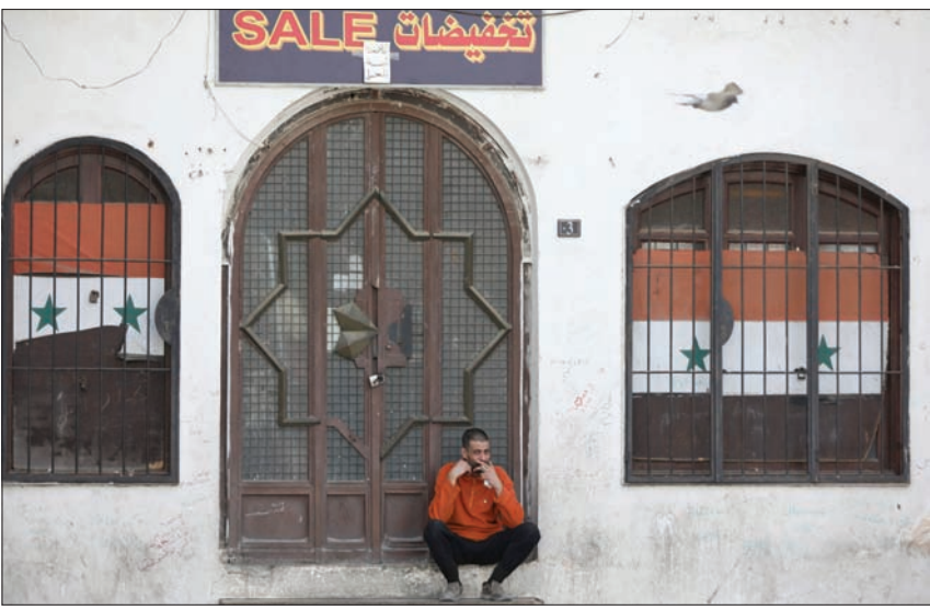
رجل يجلس أمام محل مغلق في دمشق أمس

تأمين العسكريين الروس في سوريا، ووضع البيات كافيّة لتجنب انتشار الفيروس في المرافق العسكرية وأماكن وجودهم. إذ تبدو للمسألة أبعاد أسوأ. ولفت الخبراء إلى تضمين البيان الروسي حول الزيارة عبارات لافتة عن «دفع ملف تامين المساعدات الإنسانية، وتعزيز التعاون العسكري التقني بين موسكو ودمشق». وفي حين أن الشق الأول من العبارة، يتكرر كثيراً في اللقاءات على كل المستويات، ما يعني أنه لا يستدعي زيارة على مستوى وزير الدفاع، فإن الشق الثاني كان لافتاً للانتظار، وأثار تساؤلات حول طبيعة التعاون العسكري المقصود، وهل هناك تحضير لإرسال تعزيزات عسكرية جديدة إلى سوريا، وتسلّم دمشق أسلحة جديدة؟