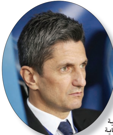
رازقان (الشرق الأوسط)

اللاعبين الذين لعبت معهم، لكن الأفضل بعد تيفين، ثم بيلو، وبوغيا». ويقضى جيوفينكو موسمه الثاني كمحترف مع نادي الهلال، والأبناء عن مغادرته الهلال مع نهاية الموسم الحالي بعد نهاية عقده الاحترافي الحالي في يونيو (حزيران) المقبل.