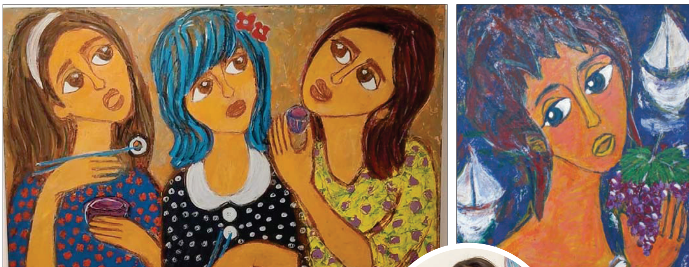
التفاصيل الغنية من سمات لوحات المعرض