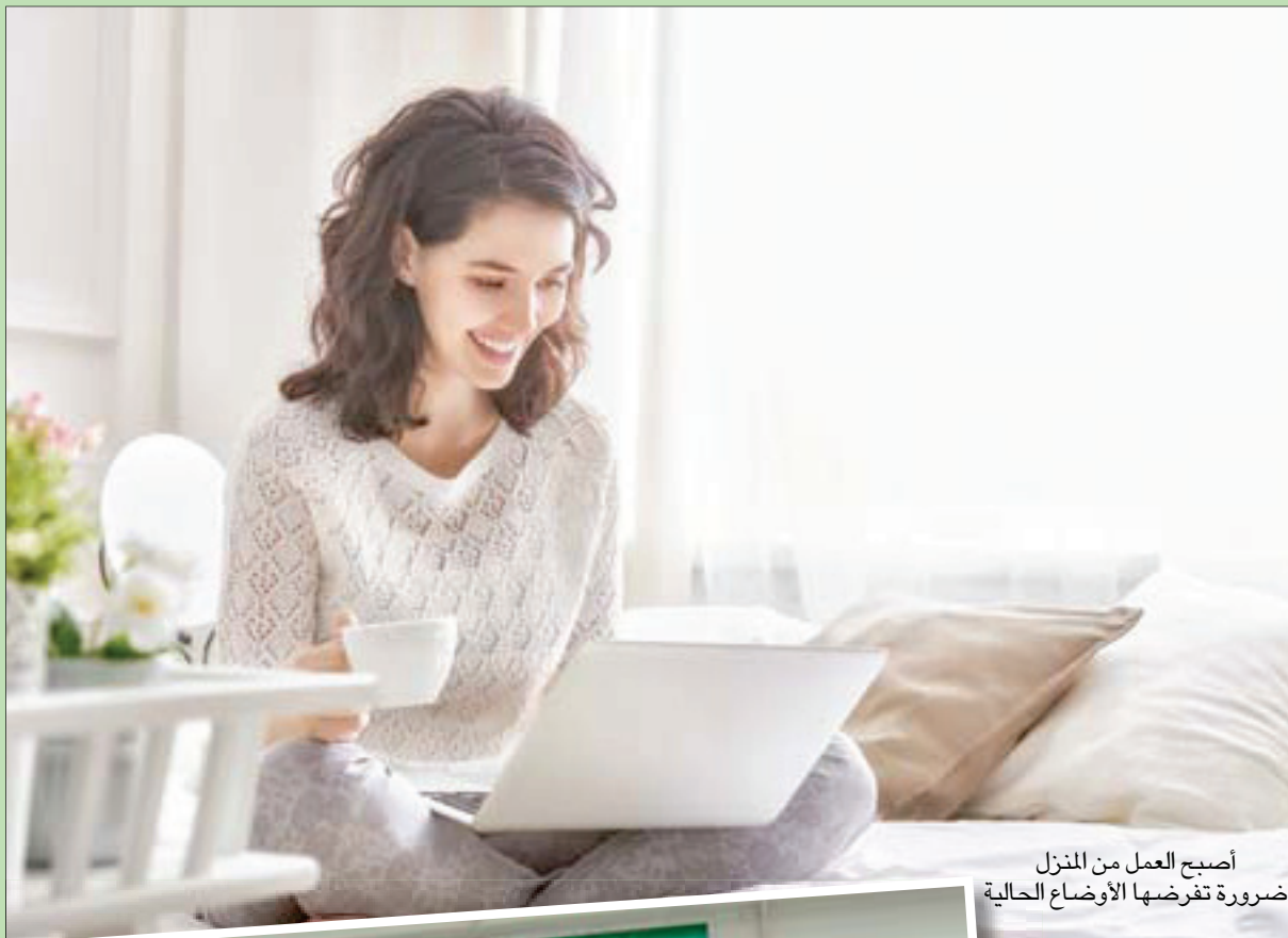
أصبح العمل من المنزل ضرورة تفرضها الأوضاع الحالية

وبما أنّ الموضة كانت ولا تزال قراءة جيدة للأوضاع الاقتصادية والسياسية والاجتماعية التي نمرّ بها، وبما أنّ كل القراءات الماضية تؤكد أنّ الناس في أوقات الأزمات، يُقبلون على كل ما يُشعرهم بالأمان والطمأنينة على المستويين النفسي والجسدي، مثل الصوف والحرير، والتصاميم الطويلة، فإن الأمر لن يختلف هذه المرة أيضاً. إلى جانب التصاميم المستوحاة من البيجاما أو «الروب دو شومير» أو الملابس الرياضية المكونة من قطعتين: بنطلون واسع وكترزة مع قلنسوة، وسنرى أنّ الطول الماكسي والميدي سيكون غالباً. بالنسبة للأحذية فإن المرحوم منها من الشبان سيستحب السجادة من تحت العكوب العالية والرفيعة بل حتى الرياضية منها، والسبب سهولة ارتعالها من دون حاجة إلى ربطها.