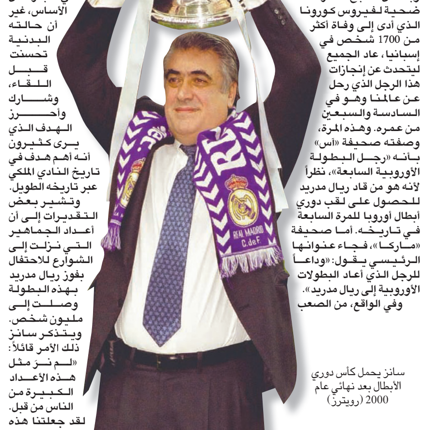
سانز يحمل كأس دوري الأبطال بعد نهائي عام 2000