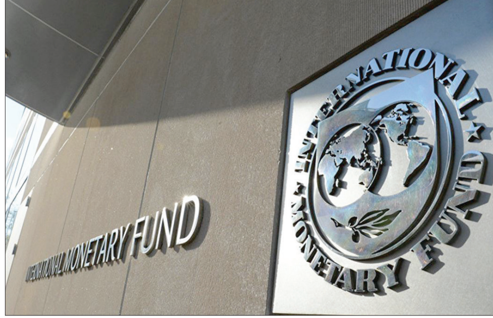
مقر صندوق النقد الدولي في واشنطن

وأشار أزغور إلى أن إجراءات الحد من الفيروس تضر بالقطاعات الرئيسية الخدمية بالوظائف مثل السياحة والضيافة والتجزئة، مما قد يؤدي إلى زيادة البطالة وتخفيض الأجور. وكانت رئاسة صندوق النقد الدولي كريستالينا غورغيفا قالت الإثنين إن النمو الاقتصادي العالمي سيكون سلبياً هذا العام، وقد يكون أسوأ من الأزمة المالية العالمية لعام 2008. واتخذت دول عديدة في المنطقة قرارات صارمة للحد من انتشار الفيروس، وبينها وقف الرحلات الجوية، وتعليق الدراسة، وإغلاق المراكز التجارية الكبرى، وفرض حظر تجول. وتسبب الفيروس بوفاء مئات الأشخاص في إيران، وعشرات آخرين في دول المنطقة.