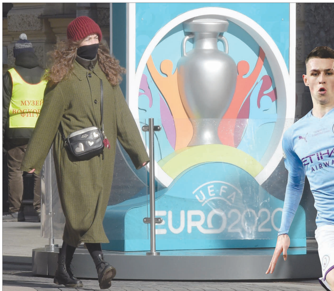
بطولة «يورو 2020» انسحبت أمام تفشي فيروس «كورونا» (أ.غ.ب)

ومن المتوقع أن يشكّل الدوري الممتاز محور الاهتمام خلال الفترة القادمة، خاصة أنه من المقرر عقد محادثات جديدة مقبلة في أعقاب تمديد فترة الإيقاف حتى نهاية أبريل (نيسان). وتشير الأنباء إلى أن إنجلترا ستضطر كثيراً من تكسد المباريات على نحو متفاقم و«خوف حقيقي» من أننا قد لا نتكمن من إنجاز