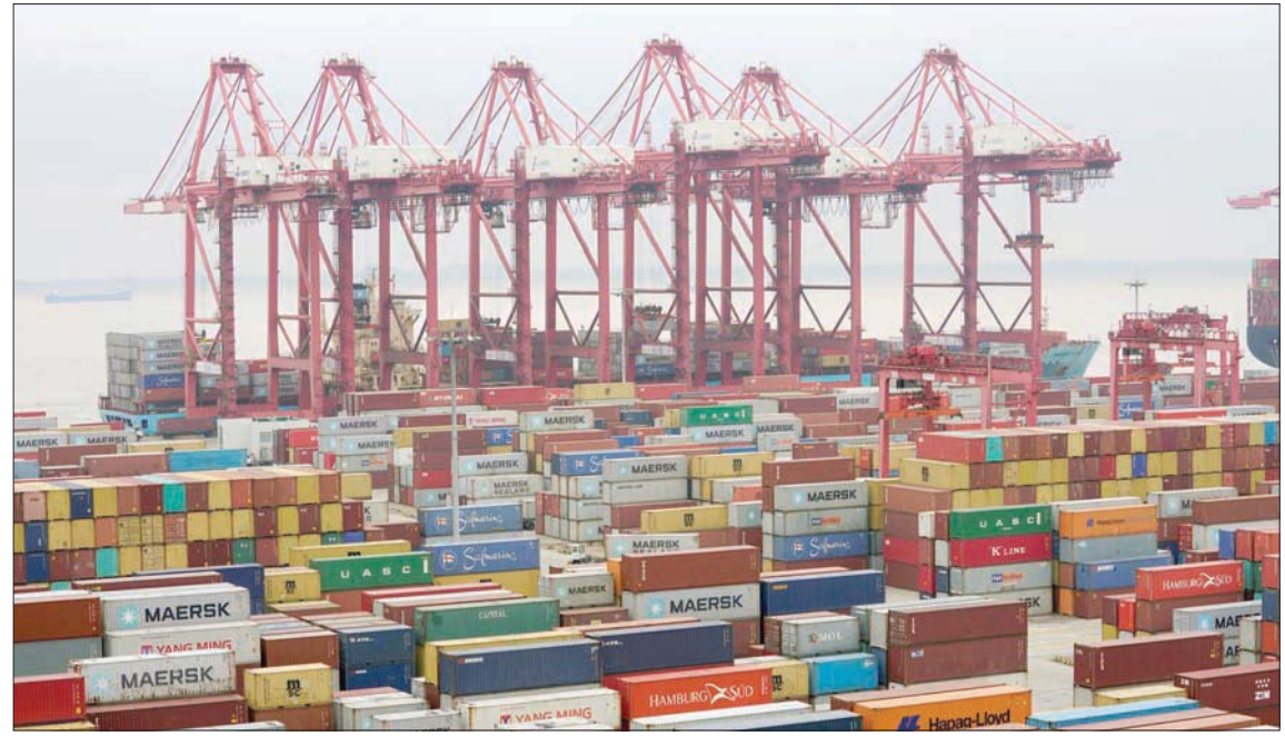
توقعت صندوق النقد للنمو العالمي في 2019 تبلغ 3,3%

دعا التقرير إلى أنه لدعم الانتعاش الدائم يتوجب على صانعي السياسة تحقيق التوازن بين مزيج السياسات المحلية، من خلال المساعدة على تخفيف السياسة النقدية على نطاق واسع، مع التيسير المالي في بعض الاقتصادات لتجنب تباطؤ عمق، والاستمرار في دعم النشاط، نظراً لأن الانتعاش المتوقع هش للغاية، وسيكون من المهم عدم سحب دعم السياسة بسرعة كبيرة. وأكد تقرير صندوق النقد أن الإصلاحات الهيكلية ضرورية على مستوى النمو على المدى المتوسط، إذ كشفت تحليلات الصندوق عن دفع النمو،