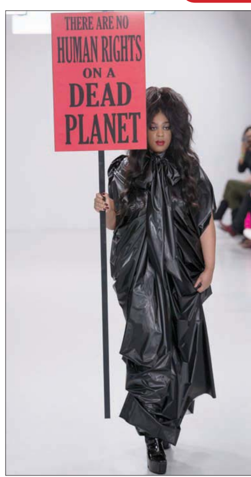
من عرض بام هونغ

مهمتهم تتطلب منهم التنقل من عاصمة إلى أخرى لمتابعة العروض واكتشاف مصممين جدد، لم يعودوا يرون أن حضورهم ضرورياً. وحتى عندما يوجدون في عواصم الموضة خلال هذه الأسابيع، فإنهم يفضلون زيارة معارض يقدم فيها مصممون شباب تصاميمهم على الجلوس في الصفوف الأمامية لمدة 20 دقيقة، فالعرض يكون في بعض الأحيان، مسرحياً بالمعنى الترفيهي الذي يركز على الديكورات والإخراج أكثر من تركيزه على الأزياء نفسها، وهو ما قد يجعلهم يعيشون التجربة ويستمتعون بها، لكنه قد يُشتت أفكارهم ويؤثر على اختياراتهم. من هذا المنظور، تتم العديد من عمليات البيع والشراء قبل أسابيع الموضة. أما بالنسبة للمصممين المبتدئين، ممن لا يمتلكون الإمكانات لتنظيم عرض أزياء تقليدي قد يتكلف ما بين 70 ألف إلى 200 ألف دولار، فإنها قد تتم عبر صفحات «الإنستغرام».