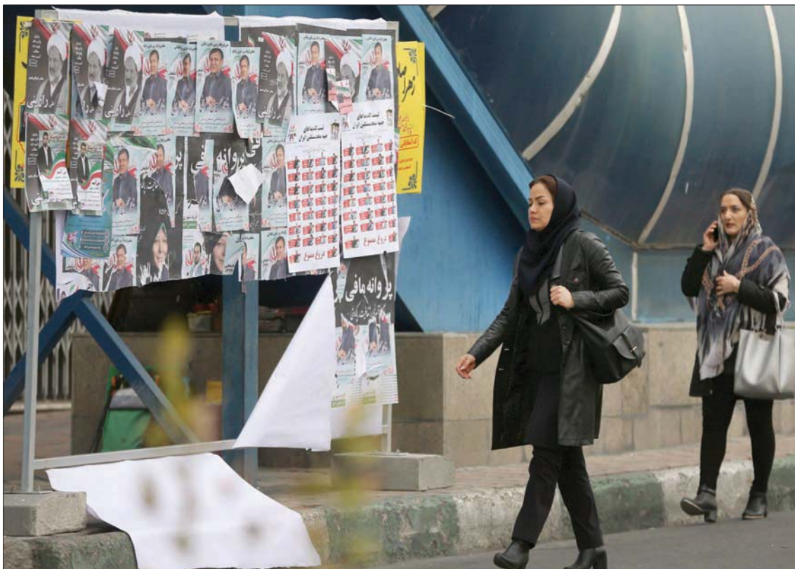
إيرانية أمام لافتة مخصصة لمرشحي الانتخابات التشريعية بشارع وسط طهران أمس

ويعتقد العديد من المعارضين في إطار النظام، غياب التعددية في هذه الانتخابات بعد إقصاء آلاف المرشحين بنسبة معظمهم من التيار المعتدل والإصلاحي، فيما تدعو المعارضة التي تطالب بتغيير النظام إلى مقاطعة الانتخابات.