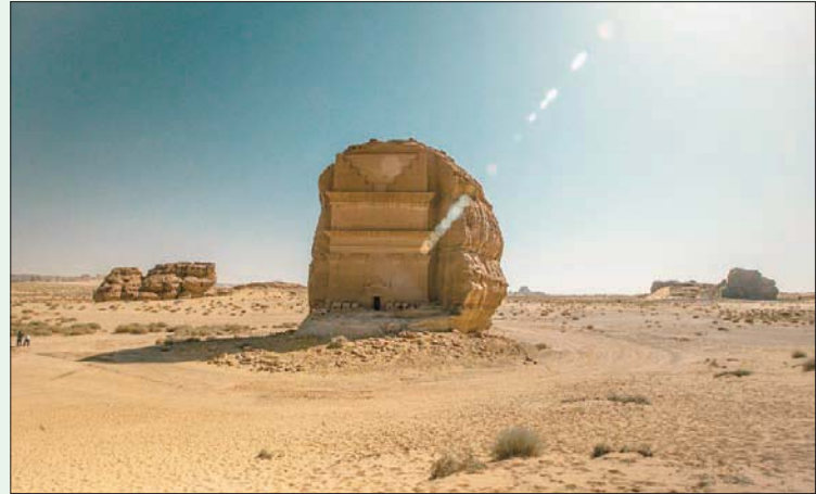
قصر «الفريد» في مدائن صالح بالعلا

الفنانة البريطانية المعاصرة لورين بيكر، واستوديو الفن المفاهيمي شوستر وموسلي بقيادة كلوديا موسلي وإدوارد شوستر. هذا بالإضافة إلى التجهيز الفني المعنون بـ «الغرفة اللامتناهية - تألق الأرواح» للفنان الياباني يويوي كوساما، المعروض في صالة مرايا للحلقات الموسيقية.