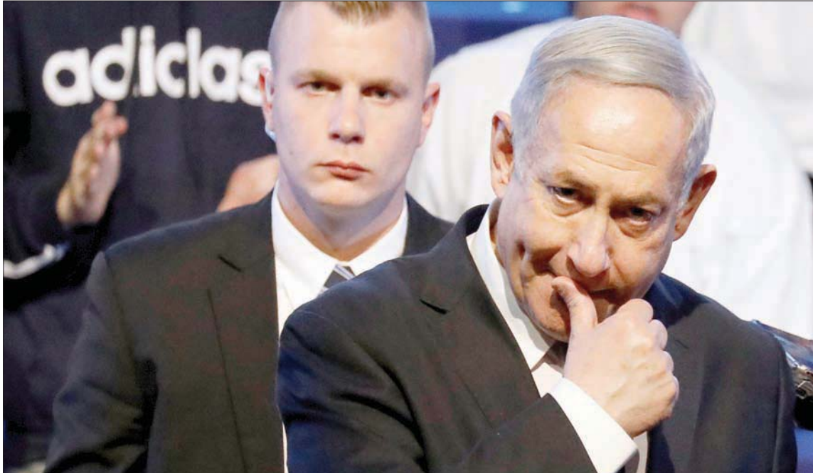
نتنياهو في حملة انتخابية وسط مؤيديه من حزب الليكود قرب تل أبيب الثلاثاء

وقد أجرى نتنياهو مقابلة صحافية مطولة مع الصحيفة العربية «بانوراما» ومحطة التلفزيون «هلا» التابعة لها وتصدر في مدينة الطيبة في هذا المثلث. وقال إنه يرى في المواطنين العرب في إسرائيل جزءاً لا يتجزأ من إسرائيل وتباهى بأنه «رئيس الحكومة الذي قدم للعرب ميزات أكثر من كل حكومات إسرائيل مجتمعة». ودعا العرب للامتناع عن التصويت للقائمة المشتركة «التي لا تحمل لكم شيئاً»، والتصويت له ولليكود «حتى أكل مسيرة المساواة في الحقوق». وأضاف: «أنا أحقق إنجازات تاريخية لإسرائيل ولكل المنطقة العربية، وأريد للعرب في إسرائيل أن يكونوا الجسر بيننا وبين أممهم العربية». وقال نتنياهو إنه لا يستبعد قيام دولة فلسطينية كما تمتد عليه خطة السلام الأميركية