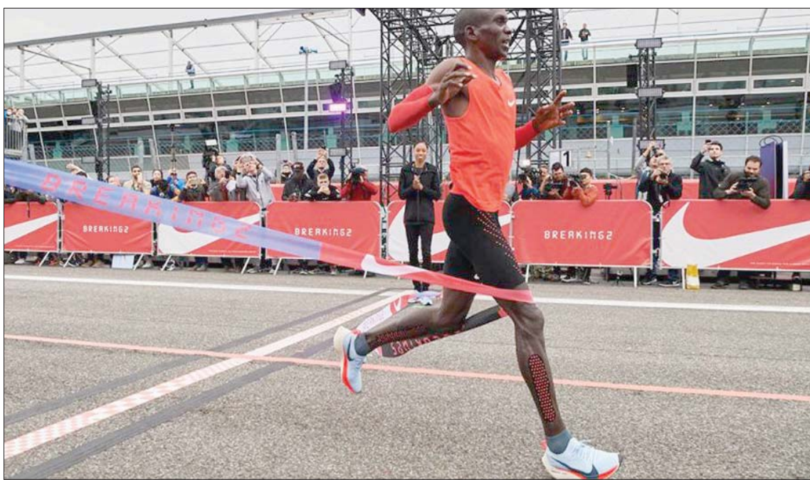
هل ساهم حذاء «فيبرفلاي» في الارتقاء بسرعة العدائين؟

سباق التسلق (هذا إذا نجحت في التفاوض مع كتيبة المحامين التابعين لـ«نايكي» والذين يحمون براءات اختراع الشركة بشراسة) أو مواجهة الخسارة. وليس من الضروري أن تكون شخصاً مثالياً أو لديك حنين جارف للماضي كي تشجع في التساؤل حول ما يمكن أن تؤدي إليه هذه الرؤية لألعاب القوى يفتقون في طليعة الثورة، تحمل نهاية الأمر. من وجهة نظر من يفتقون في طليعة الثورة، تحمل حقيقة وفرصة لإعادة رسم صورة ألعاب القوى كرياضة ترفيحية عالية القوة وقادرة على إصابة الجماهير بالذبول. جدير بالذكر أن كيبشودج سبق وأن أعلن بحماس شديد: «يجب أن نسير مع ركب التكنولوجيا»، وقرن بين الحذاء الجديد الذي ابتكرته «نايكي» ودور الشركات المصنعة لأطر السيارات في سباقات «فورمولا 1»، الأمر الذي يرسم ملامح صورة مختلفة تماماً عن صورة رياضة الجري التي نشأنا عليها. يوماً بعد آخر، لم تعد عجلة التقدم التكنولوجي مجرد عرض جانبي إضافي، وإنما أصبحت جزءاً أساسياً من المشهد ذاته.