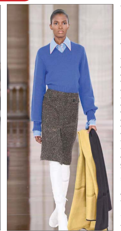
من تصاميم فيكتوريا بيكهام

إلى جانب عروض الأزياء في المقر الرئيسي بـ «80 ستراند» وأماكن أخرى متناثرة وسط وجنوب لندن، ستمشارك محلات كبيرة مثل «براونز» و«ماتشفاشن» و«توب