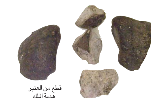
قطع من العنبر هدية الملك

وتحظى العلاقات بين البلدين باهتمام بالغ نظراً لتاريخها الذي يعود إلى عام 1931م، عندما بدأت رحلة استكشاف وإنتاج النفط في المملكة بشكل تجاري، ومنح حينها الملك عبد العزيز حق التنقيب عن النفط لشركة أميركية، تبعها توقيع اتفاقية تعاون بين البلدين عام 1933م، دعمت هذا الجانب الاقتصادي المهم الذي أضفى قوة اقتصادية عالمية في هذا العصر.