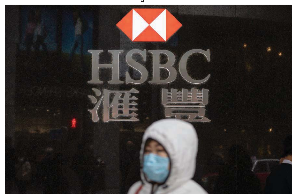
«إتش إس بي سي» البريطانية أعلنت عزمها على شطب 35 ألف وظيفة على مدار ثلاثة أعوام

الإلمانية غائبة بالكامل عن هذه اللائحة التي يتم تحديثها دورياً. في سياق متصل، يقول ديفيد كورتن، الذي عمل سابقاً مستشاراً في وزارة المال الألمانية، إن أكبر المجموعات المصرفية الأوروبية، وبينها مصرف «ويتشيه بنك»، استخرج 70 في المائة من عائداتها من الأسواق المحلية الأوروبية. ويبقى الحديث عن سوق مصرفية أوروبية فوّضة حلاً بعيد المآل. أما عمليات الدمج بين المصارف الأوروبية فهي شبه غائبة، وكان آخرها شراء مصرف «بي إن بي باريسيا» الفرنسي، مصرف «فورتيس» البلجيكي عام 2009. ويضيف هذا الخبير أن تراجع عائدات المصارف الأوروبية، ولا سيما الألمانية منها، ناجم في الأعمار الأخيرة عن أسعار الفائدة السلبية، والتوترات الجيوسياسية العالمية التي تؤثر على الحركة التجارية الدولية، التي احتضنت بدورها - حديثاً - عدة مشغلين مصرفيين رقميين، لديهم وجود تجاري حصري على الشبكة العنكبوتية، وبالتالي لا توجد لديهم تكاليف تشغيل مرتفعة، كما تلك التي تعاني منها المصارف التقليدية. ونظراً لهوامش ضيقة في منافراتها التجارية، لجأت المصارف الأوروبية إلى تسريح مئات آلاف الموظفين، واشتدت موجة التسريح هذه في عام 2012. ومنذ عام 2008 وصل إجمالي الموظفين المُسرحين