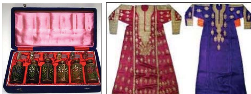
ملابس وعطورات ضمن هدايا الملك عبد العزيز للرئيس الأميركي روزفلت

ويُعدّ برنامج الابتعاث الخارجي السعودي، أبرز النقاط