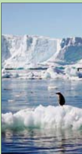
ذوبان ثلوج القطب الجنوبي

سيدني - لندن، «الشرق الأوسط» تقود ظاهرة الاحتباس الحراري إلى ذوبان واسع النطاق «لا رجوع فيه» لثلوج القارة القطبية الجنوبية، وإن تطهير الغلاف الجوي من الكربون هو الحل الوحيد لإبطاء الأمر، حسبما قالت عالمة أستراليا متخصصة في المناخ لـ«رويترز» أمس.