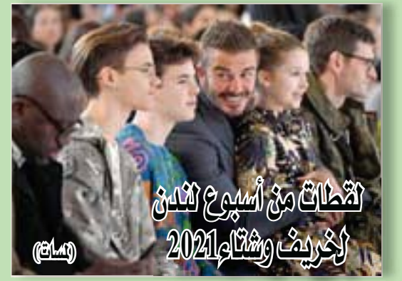
نشاطات من أسبوع لندن الخريف وشباط 2021 (ساعة)