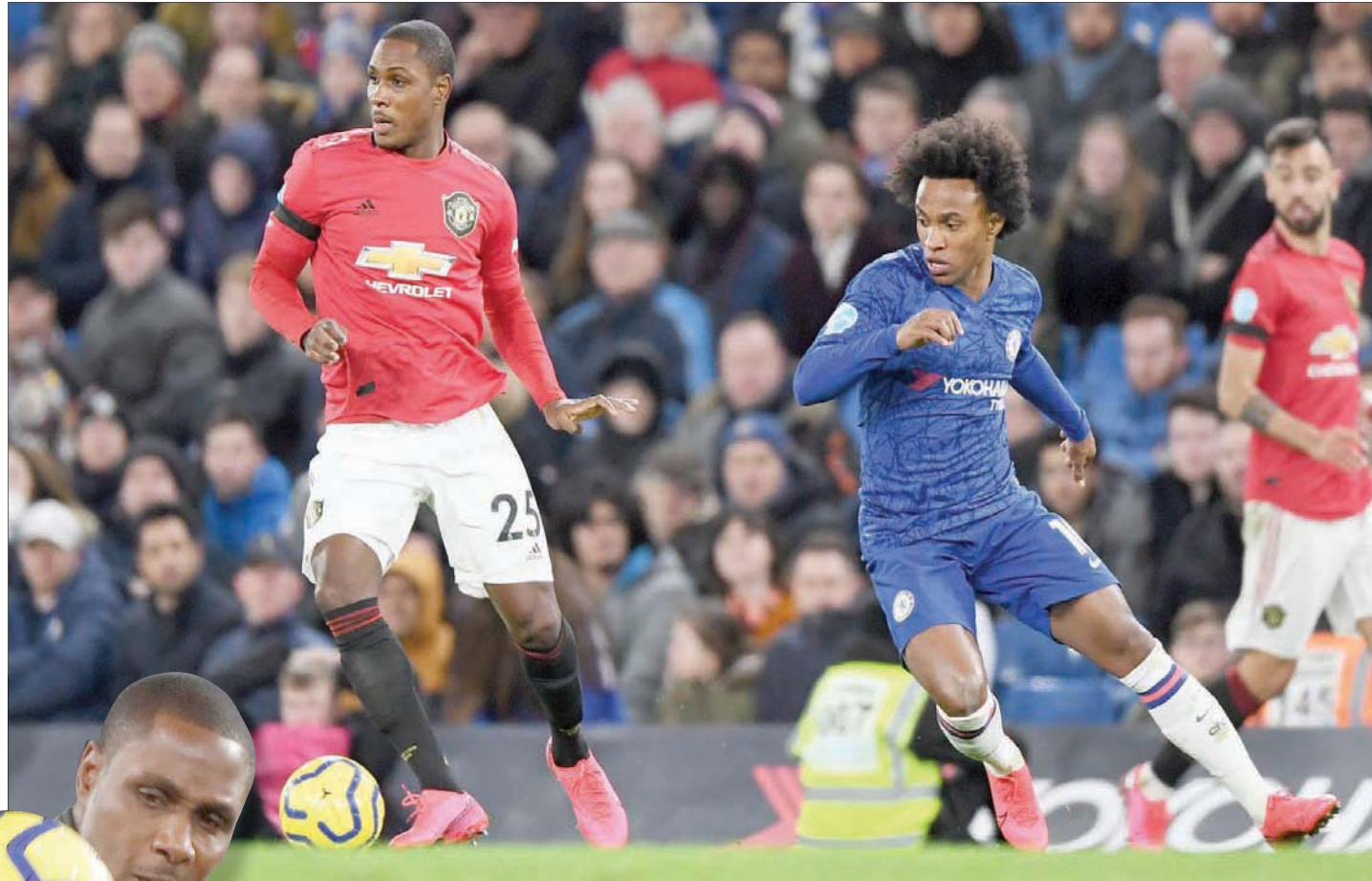
إيغالو بقميص يونايتد يسيطر على الكرة قبل ويليان لاعب تشيلسي

وعندما رحلت عن النادي، كنت أوبي وسرعة تشينيدو، اللذين كانتا استثنائيتين. كنا متوقعين أن يصل اللاعبان لمستوى أعلى، لكن فيما يخص أوديون إيغالو، لا يمكنني القول إنني توقعته له أن يحرز 15 هدفاً في واحد من مواسم الدوري الممتاز، مثلما فعل سابقاً مع وانفورد».