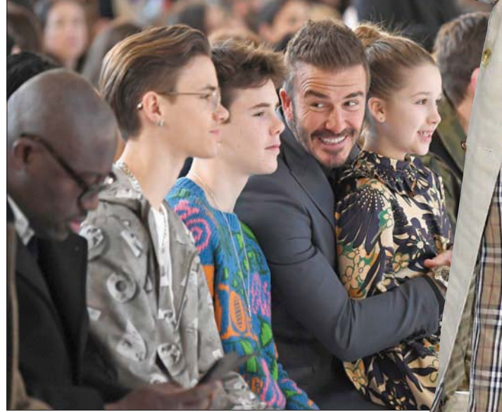
عائلة فيكتوريا بيكهام خلال عرضها في لندن

والسلامة. لم تكن الأناقة من الأولويات هذه المرة. فاهم الإكسسوارات كانت الكمادات التي تغطي نصف الوجوه خوفاً من انتقال عدوى الفيروس. وكانت كارولان راين، رئيسة مجلس البريطاني للموضة قد أعلنت في خطاب افتتحت به