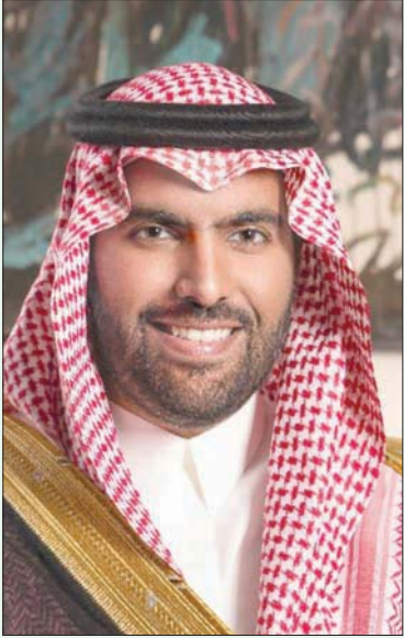
الأمير بدر بن عبد الله بن فرحان وزير الثقافة

في اللغة العربية والفن الإسلامي من مدرسة الدراسات الشرقية والأفريقية التابعة لجامعة لندن عام 1992م. وسيولى الدكتور كاربوني في هيئة المتاحف مهام متعددة تشمل رسم استراتيجية للقطاع ومنح التراخيص في المجال، وتشجيع التمويل والاستثمار، واعتماد البرامج التدريبية المهنية، إضافة إلى تصميم البرامج التعليمية ذات العلاقة وتقديم المنح الدراسية للموهوبين. وتأتي هيئة المتاحف ضمن 11 هيئة ثقافية جديدة أطلقتها وزارة الثقافة لإدارة القطاع الثقافي السعودي بمختلف تخصصاته.