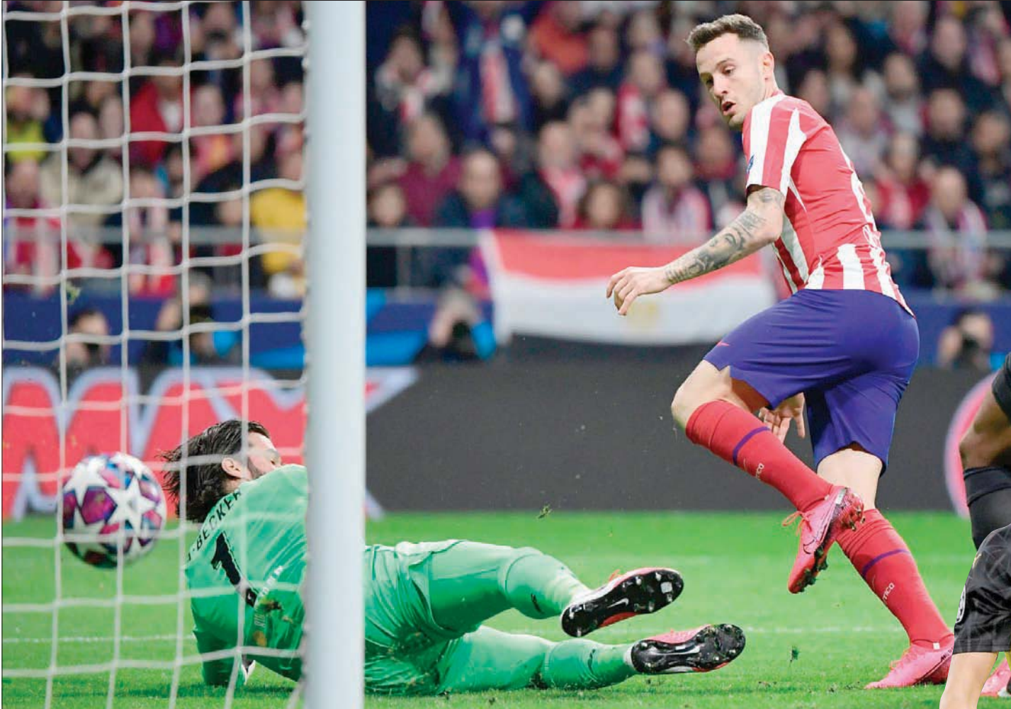
ساؤل نيفيز يسجل هدف فوز أتليتيكو في مرمى ليفربول

وأضاف: «نحن في مرحلة ما بين الشوطين، ولقد تأخرنا 1 - صفر، ونحن لا نستسلم ولو تبقى 15 دقيقة من الشوط، لذا ماذا نفع هذا ونحن لدينا ثلاثة أسابيع، والأهم من ذلك أن الشوط الثاني سيقام على ملعبنا».