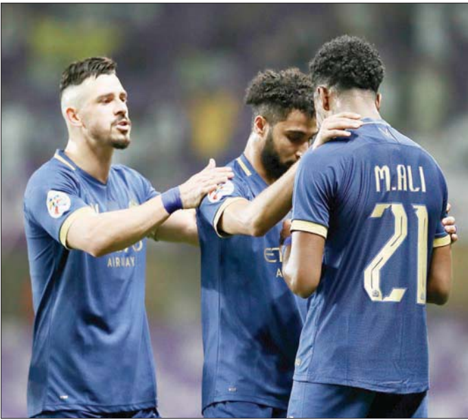
لاعبو النصر يحتفلون بهدفهم الأول في مرمى العين