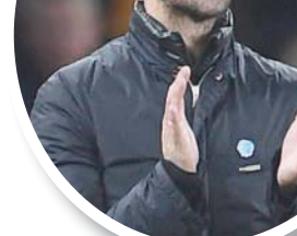
أرتيتا يأمل نقل صخرة آرسنال المحلية للدوري الأوروبي

ويشمل برنامج مباريات اليوم مواجهة وفرفرهامتون الإنجليزي مع إسبانيول الإسباني، وسبورتنغ لشبونة البرتغالي مع باشاك شهر التركي، وإف سي كوينهاغن الإسكوتلندي، كما يلقي كلوج الروماني مع إشبيلية الإسباني، ولودوغورتيس البلغاري مع إنتر ميلان الإيطالي، واينتراخت فرانكفورت الألماني مع سالزبورغ النمساوي، وشاختر دونيبتسك الأوكراني مع بنفيكا البرتغالي، وباير ليفركوزن الألماني مع بورتنو البرتغالي، وأبول القبرصي مع بازل السويسري، وإيه زد الكمار الهولندي مع لاسك لينتس النمساوي، وفولفسبورغ الألماني مع مالو السويدي، وروما الإيطالي مع غنت البلجيكي، وغلاسجو رينجرز الإسكوتلندي مع براغا البرتغالي.