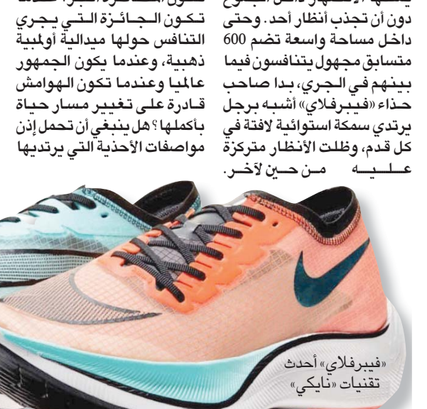
«فيبرفلاي» أحدث تقنيات «نايكي»

في الأحذية الرياضية إلى بداية العقد الأول من القرن الحالي. ونجح العداء بول تيرغات في تحقيق الرقم القياسي العالمي لسباق ماراتون مرتدياً زوجاً من حذاء «فيلاس» عام 2003، وبالمثل، ليس هناك جديد في الاستعانة برغوة تتميز بكفاءة الطاقة، والتي كانت «أيداس» الرائد الأول لها منذ ما يقرب من عقد مضى. أما الخطوة الذكية الجديدة التي اتخذتها «نايكي» في تصميم «فيبرفلاي» فهي مزج تقنيات موجودة بالفعل في حذاء واحد أعاد صياغة شكل رياضة الجري لمسافات طويلة، وذلك بدعم من «الاتحاد الدولي لألعاب القوى». واليوم، أصبح لزاماً عليك إما الانضمام إلى