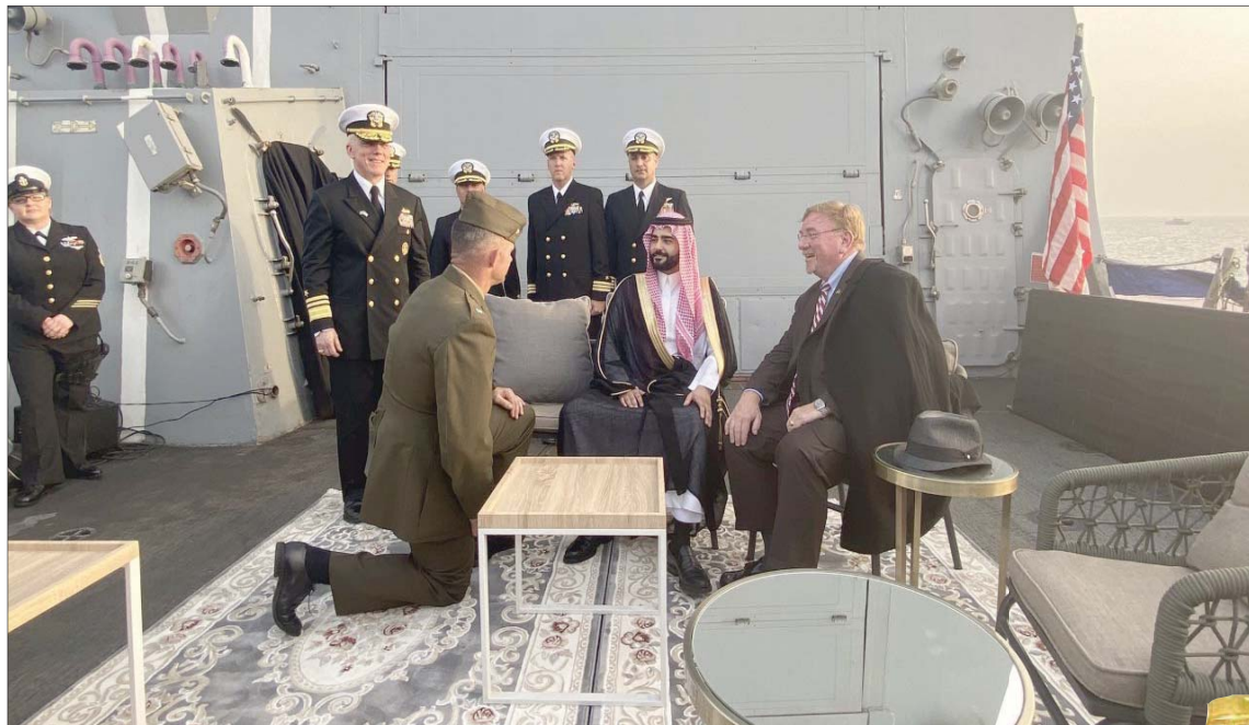
حفيد الملك عبد العزيز وروزفلت في صورة على سفينة أميركية في جدة

وبالمناسبة، التقطت صورة جمعت حفيد الملك عبد العزيز، الأمير سلطان بن أحمد بن عبد العزيز السفير السعودي لدى