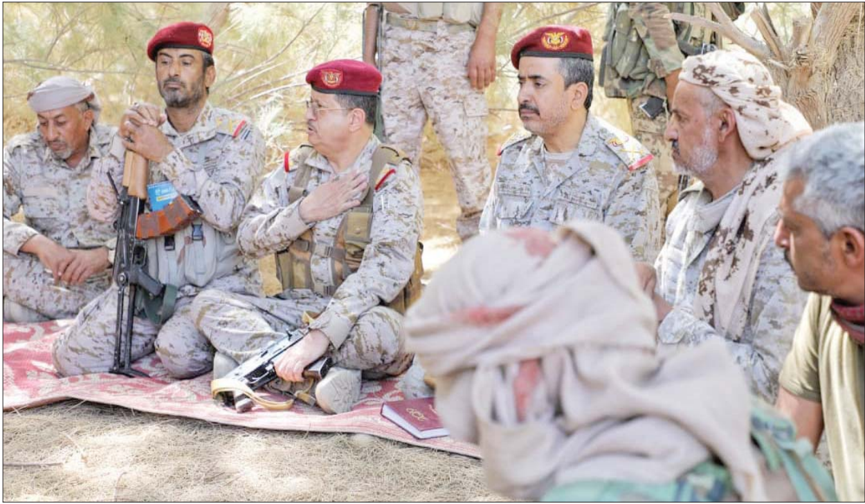
وزير الدفاع اليمني (وسط) متحدثاً مع قيادات عسكرية لدى زيارته التفقدية للجبهات في نهم شرق صنعاء أمس

أقل من 24 ساعة من إسقاط طائرة حوثية مسيرة ومفخخة في سماء الدريهمي». وكانت الميليشيات شنت مساء الثلاثاء هجوماً على مواقع القوات المشتركة، بعد إسقاط الطائرة المفخخة الحوثية، وتكثرت الميليشيات الحوثية السائل البشرية والمادية بما فيها تدمير دبابة في منطقة الشجن شرق الدريهمي، بحسب ما أوردته المصادر نفسها.