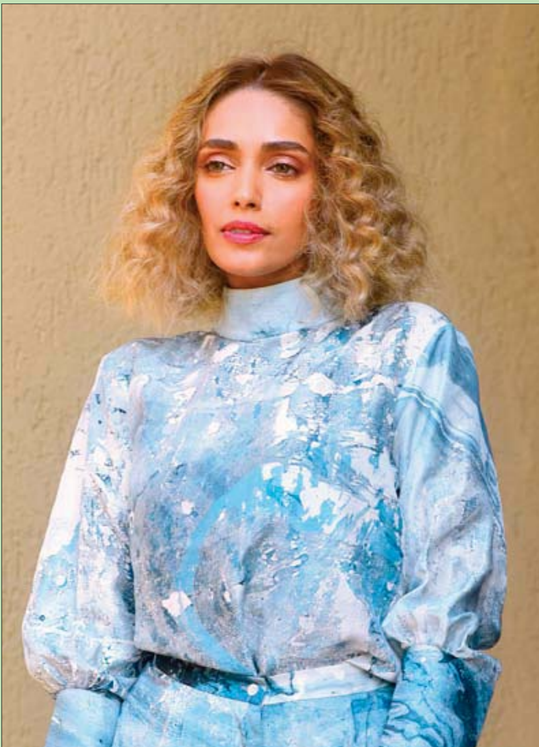
ممثلة هوليود جاس ساجو في أثناء حضورها إطلاق ألبوم الفيديو الموسيقي الهندي «أج كا جولا لا» في مومباي

وإني والله لفي عجب لماذا إصرارنا حتى الآن على استعمال هذه الأرقام المتخلفة، وهي ليس لها أصلاً علاقة بالدين لا من قريب أو بعيد حتى نتحرج، فلماذا لا نستبدل الأرقام العربية بها مثل العالم والناس، وهي التي تخزنها كل كومبيوترات وحاسبات وتليفونات العالم، وتعرفها ولا تجهلها حتى أكبر امرأة معرّفة أمية لا تقرأ ولا تكتب؟!