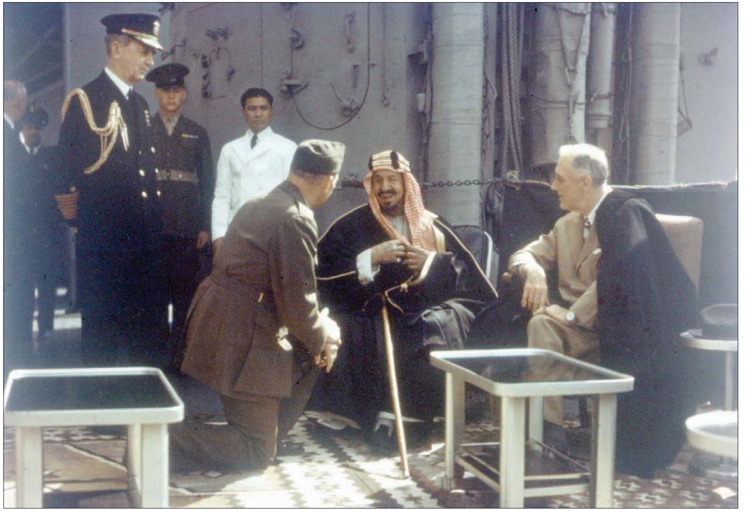
اللقاء التاريخي بين الملك عبد العزيز والرئيس روزفلت