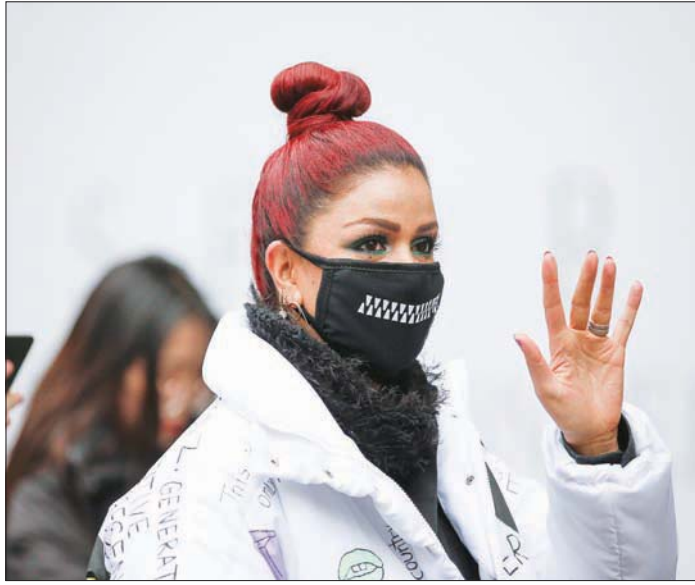
واحدة من بين العديد من الحضور الذين اختاروا السلامة على الأناقة

إن المشاكل ليست جديدة وإن «أوساط الموضة سبق أن واجهت تحديات مماثلة، وبالتالي فهي قادرة على الصمود والتكيف، رغم ما يثيره الفيروس بطبيعة الحال، من قلق». كان كلامها صحيحاً إلى حد كبير. فتنقيب تاريخ الأسبوع بلندن، يؤكد