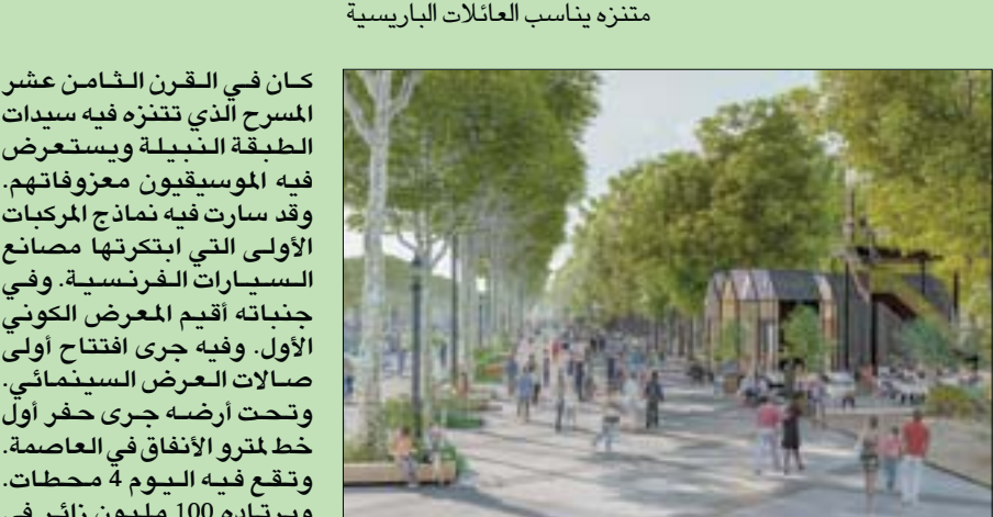
أرضيات صامتة تمتص الضجيج

ياتي تجميل الشارع الذي يوصف بأنه الأجل في العالم لاستضافة باريس للأولمبية المقررة لسنة 2024. وتقدر تكلفة المشروع المقترح بنحو 150 مليون يورو.