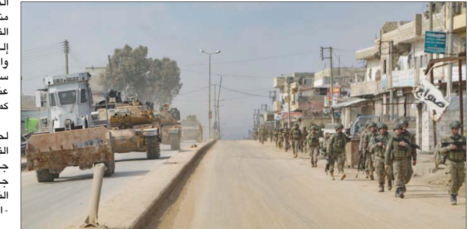
دورية تركية من المشاة في الأتارب غرب محافظة حلب قرب الحدود مع تركيا أمس (أ.ف.ب)

بذوره، أكد وزير الدفاع التركي، خلوصي أكار، عدم نية بلاده الانسحاب من نقاط المراقبة التي قامت بنشرها في محافظة إدلب، شمال غربي سوريا، وأن أنقرة سترد بالمثل في حال تعرض هذه النقاط للاستهداف. وأضاف أكار، في تصريحات بقر البرلمان التركي في أنقرة، أمس، أن تركيا تمتلك الصلاحيات لاتخاذ التدابير اللازمة من أجل تخفيف وقف إطلاق النار، وذلك بصفتها دولة ضامنة بموجب «اتفاق سوتشي» المبرم مع روسيا.