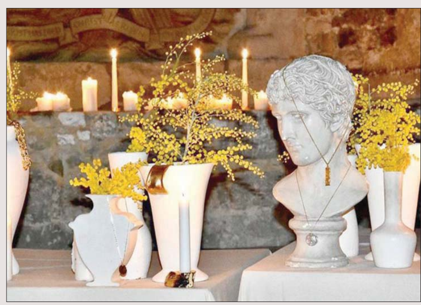
من أعمال «البيغيري»