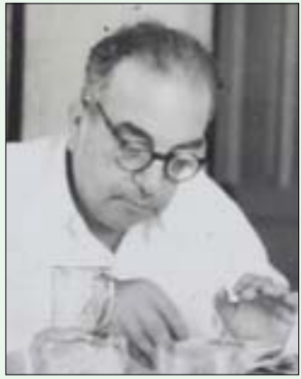
بيروت، فيثيان حداد

في السادسة والنصف من مساء اليوم الخميس 20 فبراير (شباط) الجاري وفي «دار النمر» الثقافي في بيروت ستصعد أشعار عمر الزعني، ويلقى الضوء على أعماله الغنائية الشعبية بدعوة من «نادي لكل الناس». ويتضمن برنامج هذه الأمسية التي تحيي تركة أحد الشعراء اللبنانيين الذي تركت أعماله أثراً على الثقافة الشعبية عرض فيلم مصور يحكي عنه. كما سيتم تناول أهم محطات حياته وأثرها على الماضي والحاضر. وستختتم بالتعريف عن الثورة التي قادها بأغانيه لأجل الوطن والمواطن.