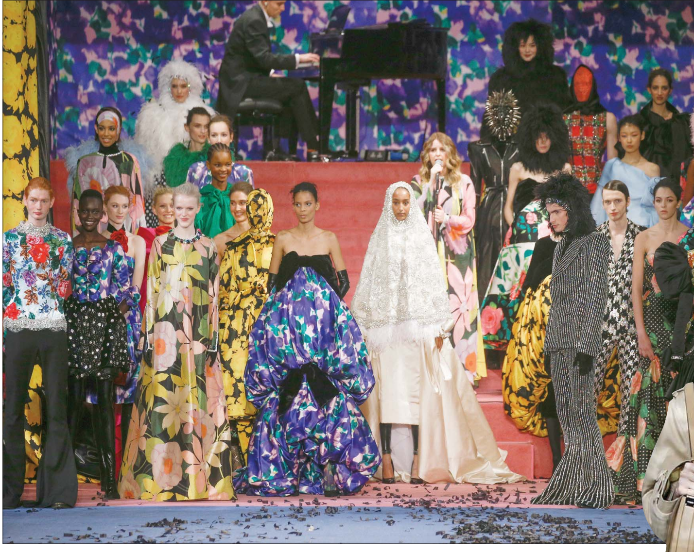
من عرض ريشارد كوين

أما كيف ترجم ريكاردو تيشي الروح الإنسانية التي أشار إليها، فمن خلال تشكيلة هادئة لعب فيها على رموز الدار مثل النقشات المربعات، مضيفاً إليها رشة أنوثة تجلت في فساتين السهرة المحددة على الجسم وفي معاطف «الترانش» التي تخللتها تفاصيل مبتكرة مثل أحزمة من الموليس كانت تتطير مع كل خطوة، وجاكيتات «بلايزن» محددة عند الخصر. كل ما في التشكيلة يؤكد أنه صممها ونصب عينيه هدف واضح يتخلص في ضرورة أن تتبع لكي تجنّب الدار أي خسائر مرتقبة، يتخوف منها صناع الموضة في كل أنحاء العالم بسبب فيروس كورونا وتأثيراته السلبية عليهم. فسوق الصين مهمة جداً وكان من المتوقع أن تنمو كثيراً في السنوات المقبلة. بالنسبة لـ «بيربري» كان يُشكل 40 في المائة تقريباً من مبيعاتها، وهو ما يعني أن الحاجة إلى تقديم تشكيلة أنيقة يسهل تسويقها أهم من أي ابتكار يستعرض فيه المصمم خياله في هذا الوقت تحديداً.