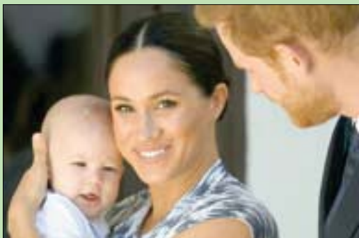
الأمير هاري وزوجته ميغان ومولدهما

وكان الأمير هاري قد قال في خطاب مفعع بالمشاعر القلبية خلال حفل عشاء مؤسسة سينتجيبال الخيرية في لندن: «يحرزني جداً أن الأمر وصل إلى هذا الحد». وقال هاري: «القرار الذي اتخذته من أجل زوجتي ومن أجلي بالتخلي عن دورنا الملكي لم يكن قراراً يمكن اتخاذه بسهولة». وتابع: «لقد كان هناك محادثات استمرت لعدة أشهر تلت عدة سنوات من التحديات وأنا أعلم أنني لم أكن دائماً على صواب، لكن فيما يتعلق بذلك، لم يكن هناك خيار آخر». وسبق للزوجين أن شجبا التغطية المتخلفة وغير الدقيقة من الصحافة