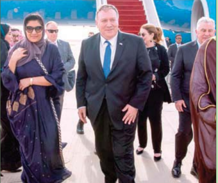
الأميرة ريماء بنت بندر في استقبال الوزير بومبيو وبموجب زوجته في مطار الرياض أمس