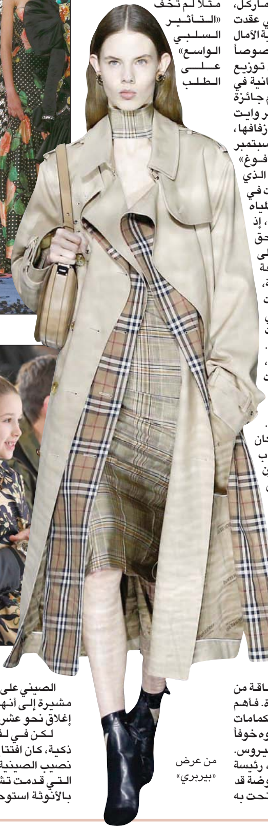
من عرض «بيربري»