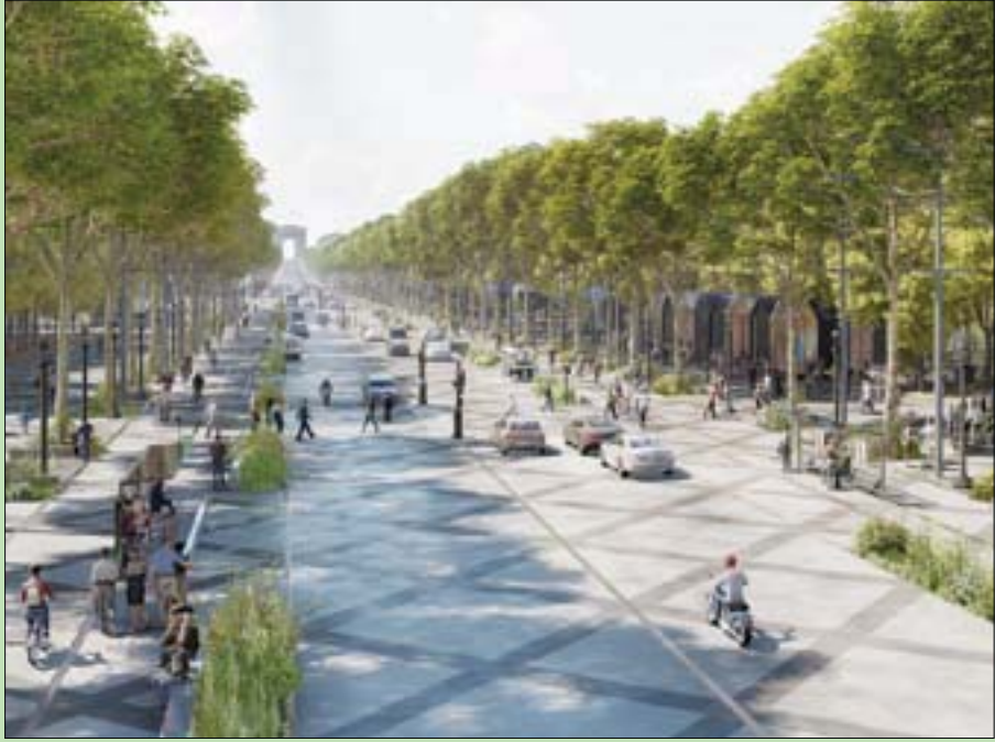
باريس، «الشرق الأوسط»

أصيب المسؤولون في بلدية العاصمة الفرنسية بالصدمة حين كشفت الأرقام أن 5 في المائة، فحسب، من الباريسيين يرتادون «الشانزليزيه». لقد سحب من تحت أقدام أهالي المدينة وبات الباريسي غريب الوجه واللسان في خضم اليابانيين والأميركيين والخليجيين والروس. وجاء في استطلاع حديث للرأي أن 71 في المائة من سكان العاصمة يعتبرون هذا الشارع مركزاً سياحياً أكثر منه مكاناً للعائلات. وقال 26 في المائة إنه كثير الضجيج، بينما يرى 10 في المائة أن التجول فيه يسبب القلق ويشكل خطراً على السلامة. لذلك طلبت البلدية دراسات لخطط تسمح بإعادة تخطيط الشارع والمنطقة المحيطة به والممتدة من قوس النصر شرقاً، حتى ساحة «الكونكورد» غرباً.