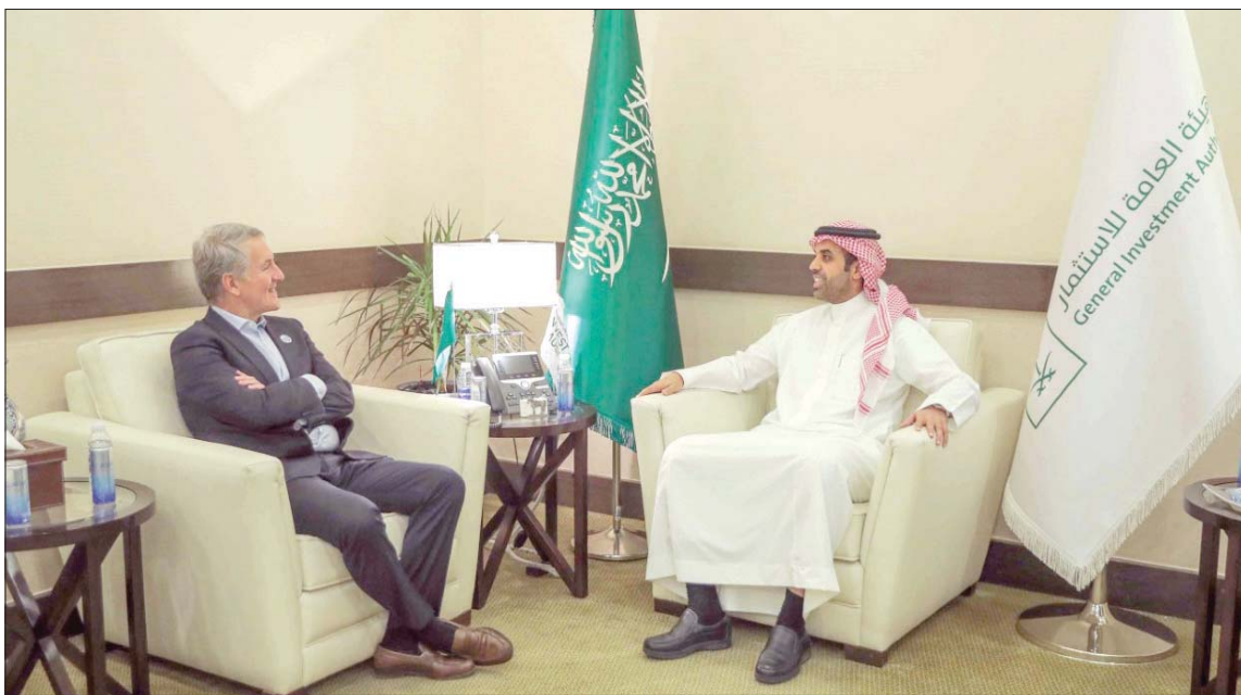
جانب من اجتماع محافظ هيئة الاستثمار السعودية ورئيس مجلس إدارة «بيبيسيكو» في الرياض أمس

السعودية، موضحاً أنه تماشياً مع رؤية المملكة 2030. ركزت استراتيجية «بيبيسيكو» بشكل خاص على تمكين المرأة السعودية كأحدى أولوياتها، حيث أطلقت الشركة منصة «تمكيني» لتمكين المرأة، حيث تقوم هذه المنصة بتقديم التوجيه والإرشاد وتوفير فرص التطوير المهني لها. وأضاف أنه من المتوقع أن تقدم الشركة خلال الأربع سنوات المقبلة قرابة 16 مليون ريال (4,27 مليار دولار) في برامج الدعم الاجتماعي، وخاصة المتعلقة بتمكين المرأة والشباب، إضافة إلى دعم مشاريع لأستدامة تعنى بالمحافظة على المياه