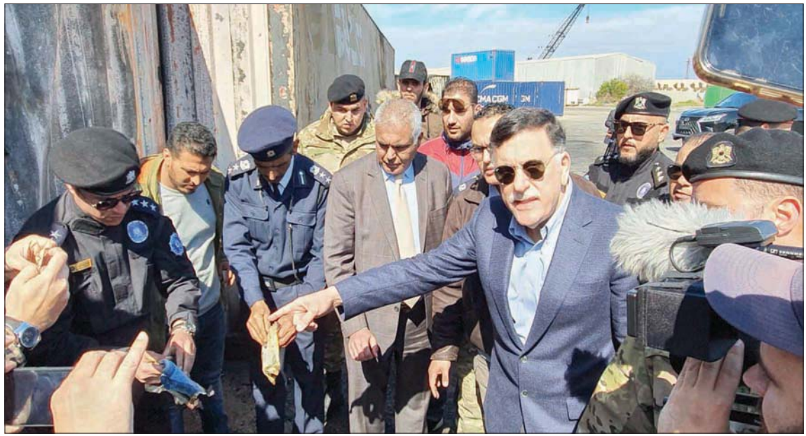
رئيس حكومة الوفاق الليبي فائز السراج يتفقد ميناء طرابلس بعد تعرضه لهجوم أول من أمس

من جانبها، توقعته وزارة الخارجية بحكومة السراج فشل الخطة المقترحة من الاتحاد الأوروبي بشأن حظر تدفق الأسلحة إلى ليبيا، وقالت إنها ستفشل بشكلها الحالي خاصة على الحدود البرية والجوية بالمنطقة الشرقية.