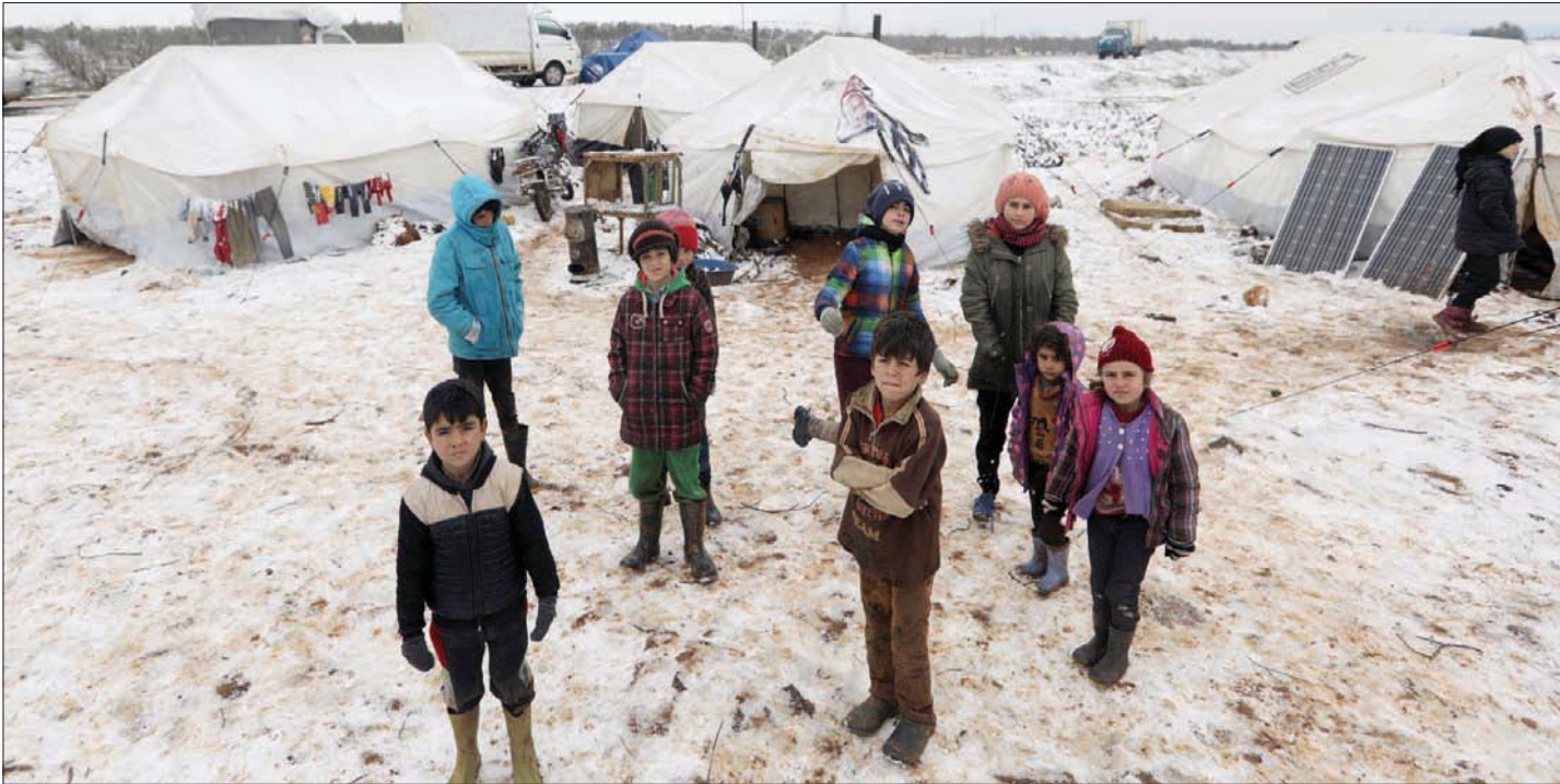
أطفال في مخيم قرب أعزاز شمال غربي سوريا نزحوا مع عائلاتهم بسبب قصف الطيران الحربي

التصعيد في إدلب وقالت: إنه «الفترة طويلة، جرت الاستعانة بروسيا ونموذج (آستانة) للتوصل الأمر واضحاً في السابق، لكن الآن من المؤكد أنه لم يعد من المناسب الوثوق بمجموعة (آستانة) لإنهاء العنف»، واعتبرت أن «الوضع طريق لوضع حد فوري للعنف في شمال غربي سوريا، هي أن تتحمل الأمم المتحدة المسؤولية الكاملة عن مبادرة جديدة لوقف النار».