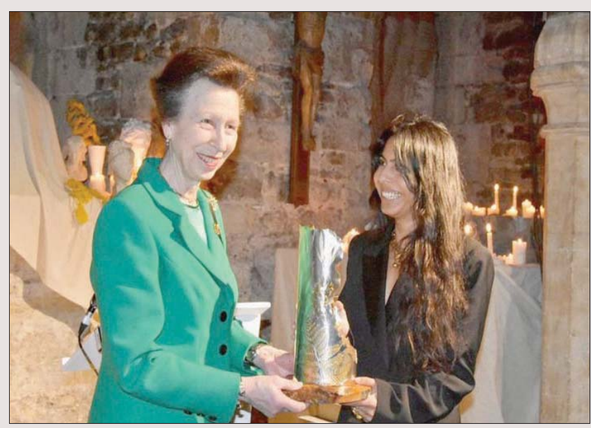
الأميرة آن تسلم الجائزة لروث ماهاتاني

دعم الجائزة بهذه الطريقة لم يكن مجرد اعتراف بصناعة تدر المليارات على اقتصاد البلد؛ بل لمباركة أفكار «إيجابية» لها تأثير بعيد المدى على حياتنا، سواء بإثارة الانتباه