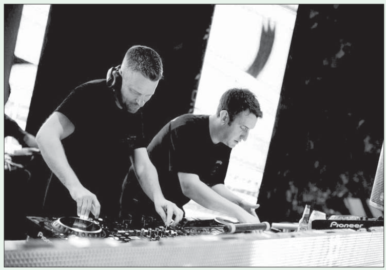
الفريق الغنائي العالمي «هولافونيك»