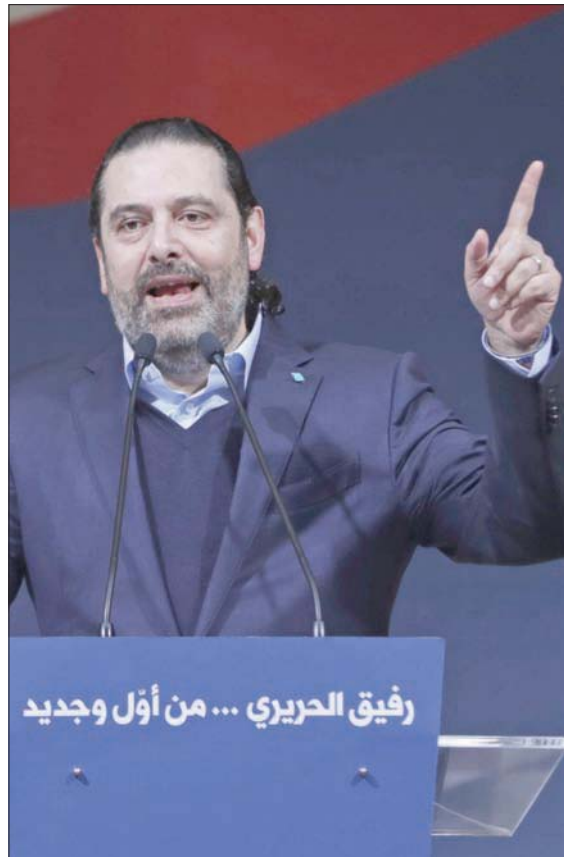
الرئيس سعد الحريري متحدثاً أمس في ذكرى اغتيال والده

تشرين يوم مفصلي وجرس إنذار للعهد والحكومة ومجلس النواب... شخص واحد فقط، لا يريد أن يرى، ولا يريد لأحد في قصر بعبدنا أن يرى». ورأى أن «التحريك الشعبي صار شريكاً بالقرار السياسي»، مذكراً بأنه كان ولا يزال يؤيد انتخابات مبكرة، داعياً الجميع للتفكير بهدوء ومن دون مزایدات. ولفت إلى أن «كتلة المستقبل، ستقدم اقتراح قانون جديد كما ورد في اتفاق الطائف، بأسرع وقت». وعن الأزمة الاقتصادية الراهنة، قال: «نحن في لبنان لسنا في جزيرة اقتصادية بمعزل عن دعم الأصدقاء والدول المانحة والمؤسسات المالية الدولية، وغياب الثقة مع الإثراء العرب، وتحديدًا مع مصر والسعودية والإمارات والكويت وباقي دول الخليج العربي. من يرى غير ذلك لنجرب كل النظريات الاقتصادية». أموال إيران الكاش تحل أزمة حزب... لكنها لا تحل أزمة بلد. الدولة لم يعد ممكناً أن تسير بالفقز بدون سياسات واضحة، وبدون مصالحت جدية رب العالمين».