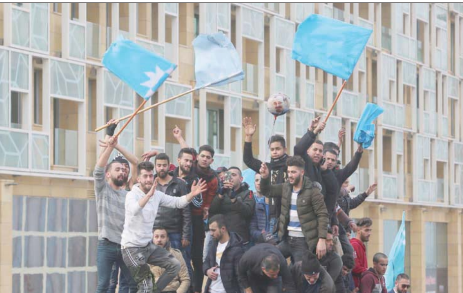
مناصرون لتيار «المستقبل» في بيروت أمس بمناسبة إحياء ذكرى اغتيال الرئيس رفيق الحريري

اندلع إشكال بين مناصرين لـ«تيار المستقبل» ومتظاهرين في ساحة الشهداء، أمس، وأطلق المتظاهرون هتاف «كلن يعني كلن»، ما اعتبره مناصرو «المستقبل» استفزازاً لهم، قبل أن يتدخل الجيش ويطلق الحادّ. الرسمية بأن إشكالا وقع قرب ضريح الرئيس رفيق الحريري، على خلفية تبادل الهتافات، حيث أطلق مؤيدو «المستقبل» شعارات داعمة للرئيس سعد الحريري، قبلتها هتافات باسم الانتفاضة أطلقها المحتجون الآخرون، وهو ما اعتبره مناصرو «المستقبل» نوعاً من الاستفزاز لهم. وشهدت الساحة اندفاعاً ورسقاً بزجاجات المياه والحصى بين المحتجين المعصمين في ساحة الشهداء، ومناصري تيار «المستقبل». وتدخلت عناصر من الجيش والقوى الأمنية في محاولة لفضل المتظاهرين بين الطرفين.