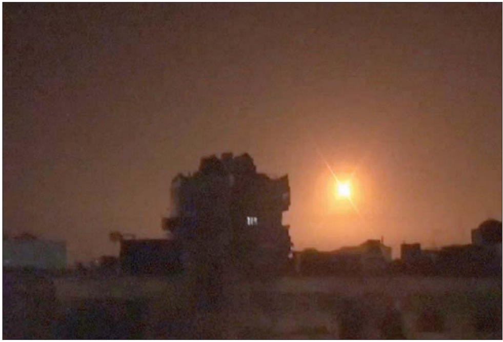
مضادات جوية سورية تتصدى للغارات الإسرائيلية قرب دمشق ليل الخميس - الجمعة

إيران خارج سوريا. وإنما نقول لهم - أي الإيرانيين - ستتحول سوريا إلى فينتام الإيرانية، وستواصلون النزف حتى مغادرة آخر جندي إيراني الأراضي السورية». 6- دعم أميركي: أعلنت واشنطن أنها ستواصل الضغط على إيران في سوريا، وقال المبعوث الأميركي إلى سوريا جيمس جيفري في أنقرة «إن بلادنا ستحافظ على وجودها العسكري في قاعدة التفن جنوب شرقي سوريا وشرق الغرات قرب حدود العراق، علماً بأن التفن تقدم دعماً استخباراتياً لغارات إسرائيل في سوريا (والعراق قبل توقفها) وترمي لقطع طريق طهران - بغداد - دمشق - بيروت، حسب دبلوماسيين». 7- موقف إسرائيل: كان رئيس الوزراء الإسرائيلي بنيامين نتنياهو أعلن سابقاً أن الغارات استهدفت «فيلق القدس المكلف العمليات الخارجية لدى إيران، كان ضمن الأهداف»، لافتاً إلى «إجراءات ضرورية لمنع نقل أسلحة قاتلة من إيران نحو سوريا سواء جواً أو براً»، فسر كلام نتنياهو على أنه يريد توظيف ذلك في الانتخابات بداية الشهر المقبل. 8- توتر بين اللاعبيين: الحملة أتت بعد يومين من غارة أميركية