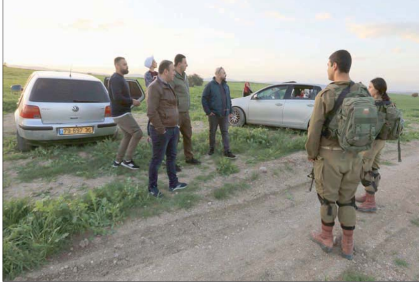
جنود إسرائيليون عند السياج بين ضفتي الغور يمنعون مرور عائلات من المرور إليه