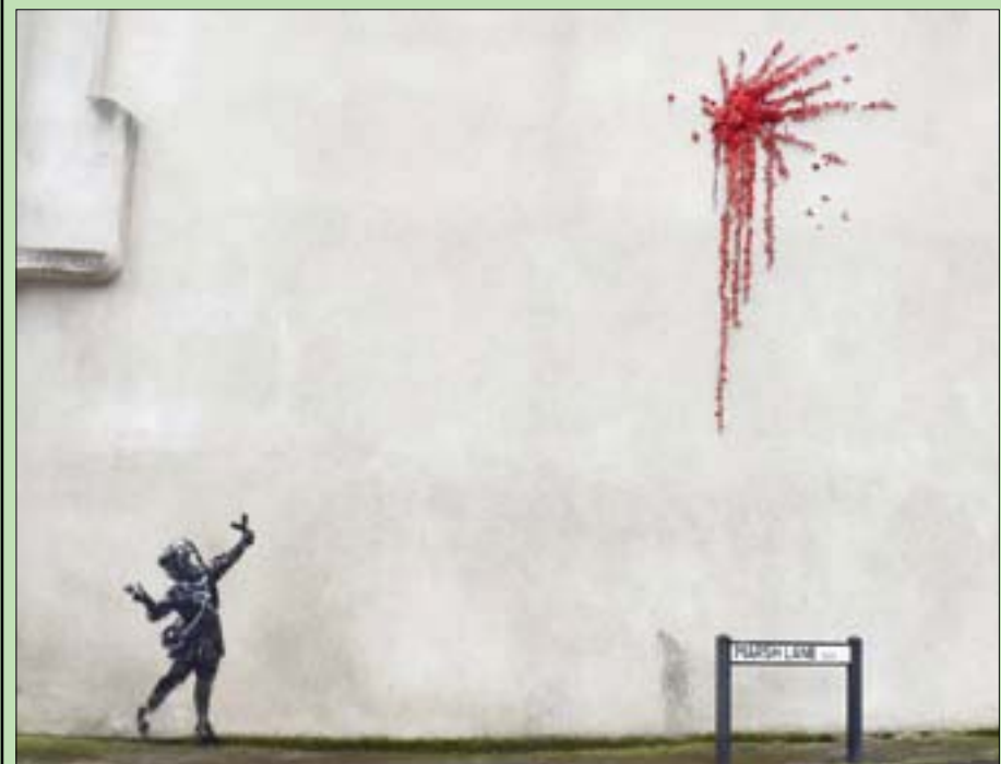
جدارية بانكسي التي ظهرت في بريستول

المشردين جدارية تصور غزالين من نوع الرنة وهما تجران مشرداً نانما على مقعد حديقة في مدينة برمنغهام في وسط إنجلترا.