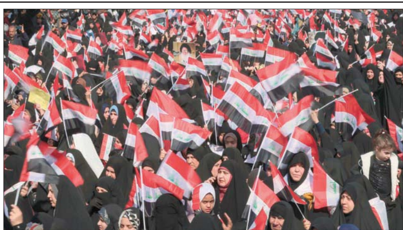
مظاهرة نسوية نظمتها التيار الصدري في مدينة الصدر ببغداد أمس (أب)

وصادق وزراء الدفاع لدول الحلف الأطلسي خلال اجتماعاتهم الأربعاء والخميس في بروكسل على نقل بعض أنشطة التحالف إلى بعثة الحلف الأطلسي، على أن يتم تعزيز البعثة بوحدة من التحالف. وبعد أن وافقت الحكومة العراقية ليل الأربعة الخميني على نقل بعض الأنشطة التدريب إلى الحلف الأطلسي، من المتوقع أن يتم تعزيز البعثة بشكل سريع. وقال الأمين العام للحلف الأطلسي ينس ستولتنبرغ الخميس إنه سيجري في الحلف الأطلسي.