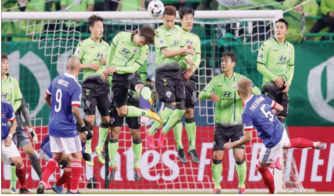
تراجع ملحوظ في عمليات العش والتلاعب في الماويات الأسوية

قال الاتحاد الآسيوي لكرة القدم وهيبة النزاهة العاملة معه إن كرة القدم الآسيوية شهدت تراجعاً كبيراً في عمليات العش والتلاعب في المباريات خلال الأعوام الستة الأخيرة رغم زيادة المراهات غير العلنية، وذلك يعود جزئياً إلى استخدام العملات الرقمية في الدفع. ولعبت مؤسسة سيورتنس رادار التي تتخذ من سويسرا مقراً لها دوراً بارزاً في حملة الاتحاد الآسيوي لكرة القدم ضد الفساد منذ 2013، وسيستمر الارتباط بين الطرفين حتى كأس آسيا في الصين في 2023 بعد تحديد التعاقد بينهما في الشهر الماضي. ويتعزز العش والتلاعب في المباريات من خلال المراهات غير القانونية، وهي سوق قدرت قيمتها منظمة الشفافية الدولية في 2018 بنحو 400 مليار دولار في آسيا. وقال بنوا باسكير المستشار العام للاتحاد الآسيوي ورئيس الشؤون القانونية: «منذ 2013 شهدنا تراجعاً كبيراً في عدد حالات العش المرتبطة بالتلاعب في المباريات». ولعبت سيورتنس رادار دوراً محورياً في هذا التراجع في إجمالي الأنشطة السرية.