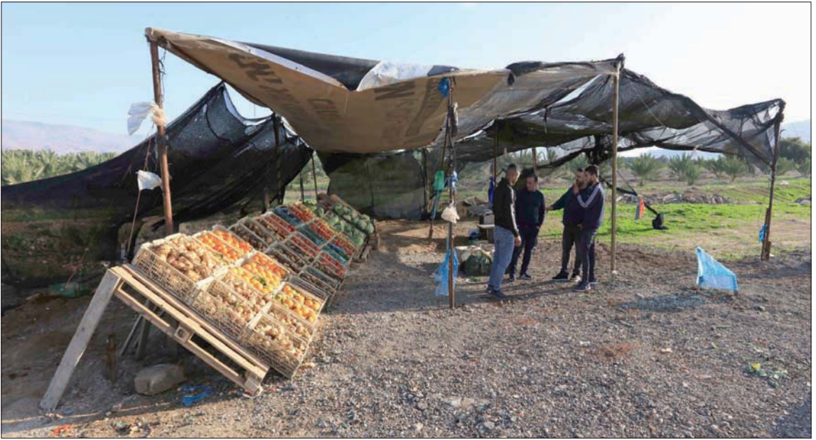
مزارعون من مرج نجعة يعرضون منتجاتهم على «طريق 90»

قلنا لهم إننا في مكان مفتوح على أرض فلسطينية ولم نجذب أي عواقب أمنية، فابتسمت مجددة لم تتجاوز أول العشرينات ابتسامة صفراء وساخرة، وقالت إنها ستحتجزنا هنا في هذه الأرض التي نقول إنها فلسطينية عدة ساعات حسب رغبتها. كانت تريد الرد علينا بمنطق حكومتها. القوة هنا هي التي تقرر وليس الحق.