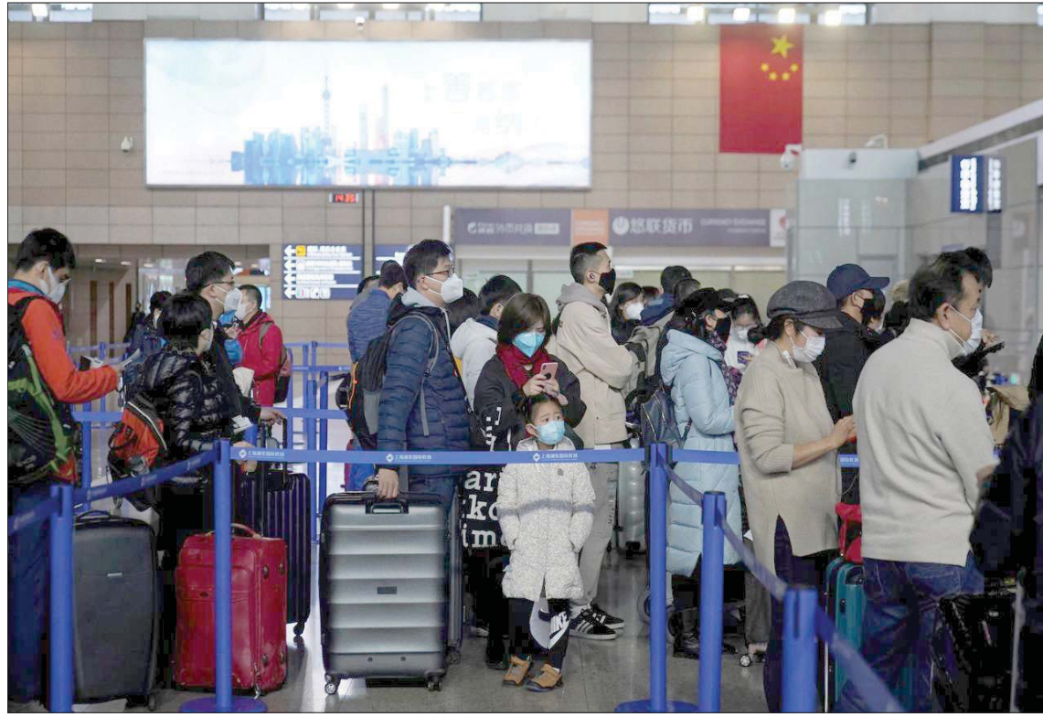
ركاب يرتدون أقنعة في مطار بودونغ الدولي في شنغهاي بالصين

انتشار الفيروس المسبب لوباء «كوفيد - 19» باقتصاد الصين وتبعاته على العالم، وأصيب بالوباء في الصين أكثر من 64600 شخص، بينما بلغ عدد الوفيات في البلاد من جراء الفيروس التفسني 1483 شخصاً. وفي غضون ذلك، أعلنت شركة الخطوط الجوية الألمانية (لوفتهانزا) أنها ستعلق جميع رحلاتها إلى الصين حتى 28 مارس (آذار) المقبل، بسبب تفشي فيروس كورونا الجديد، بحسب ما نقلته شبكة «سكاي نيوز» البريطانية الجمعة، دون مزيد من التفاصيل. كما قررت سلطات النقل الجوي في روسيا، تعليق رحلات الطيران المستأجرة بين روسيا والصين اعتباراً من 14 فبراير (شباط) الجاري، مع استثناء رحلات إعادة المواطنين الروس إلى موطنهم فقط. وذكرت وكالة أنباء «ناس» الروسية أن سلطات النقل الجوي علقت رحلات الطيران المنتظمة من المناطق الروسية إلى المدن الصينية رسمياً منذ مطلع شهر فبراير الجاري بسبب تفشي فيروس كورونا الجديد في