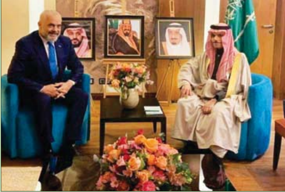
الأمير فيصل بن فرحان خلال لقائه رئيس وزراء ألمانيا أمس

من جانبها، شددت الأميرة ربما بنت بندر بن سلطان خلال كلمتها على أهمية العلاقات السعودية - الأمريكية التي بدأت منذ 75 عاماً في فبراير (شباط) 1945. مستحضرة مناقب الملك عبد العزيز ووصفته بالقائد العظيم، فيما نوهت بدور الرئيس روزفلت الذي قاد الولايات المتحدة خلال أزمته العسكرية والحرب العالمية الثانية. وشكرت الأميرة ربما بنت بندر في نهاية كلمتها، الحضور على مشاركتهم الاحتفال بذكرى لقاء القائدين العظيمين الذي يمتد إرثهما منذ بدء العلاقات الثنائية وما حققاه من جلب للأمن والاستقرار للعالم.