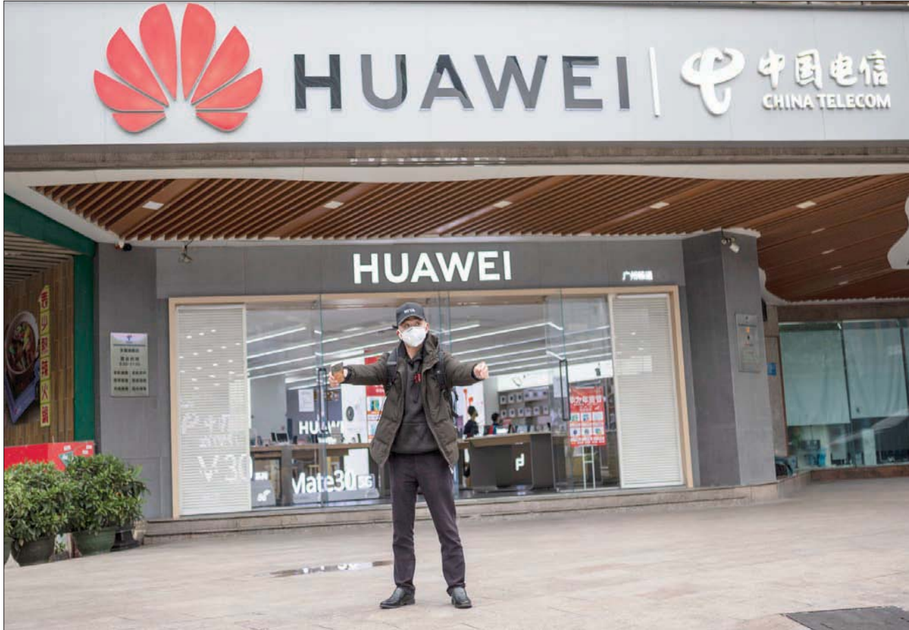
«هواوي» ستكون من بين الأكثر تضرراً بسبب انتشار فيروس «كورونا»

«الشفافية» مع المجتمع الدولي منذ بدء تفشي الفيروس. وأضاف، كما نقلت عنه «وكالة الأنباء الألمانية»، أن «الصين تنتهج دائماً تعاوناً إيجابياً ومفتوحاً مع الولايات المتحدة». وتابع أن الأجهزة الصحية في البلدين تقيم منذ بداية الأزمة تواصلاً وثيقاً، وتبادل المعلومات «بأسرع وقت»، وتأتي الانتقادات الأميركية بينما أعلنت السلطات الصحية في هوبي، أول من أمس (الخميس)، تغييراً في النظام المعتمد لرصد الوباء، تحتسب بموجبه الحالات «لمشخصة سريريا»، أي أن صورة شعاعية للرئتين باتت كافية لتشخيص الإصابة، في حين كان لا بد حتى الآن من إجراء فحص الحمض النووي للفيروس لتأكيد الإصابة به. وادت هذه الوسيلة الجديدة لرصد الإصابة بشكل أوتوماتيكي إلى زيادة عدد الوفيات والإصابات مع الإعلان عن زيادة قدرها 15 ألفاً في عدد الإصابات أول من أمس، وأكثر من خمسة آلاف، أمس (الجمعة)، وصوّتت الصين أرقامها على مستوى البلاد، حيث لم يتوافق تحديدها