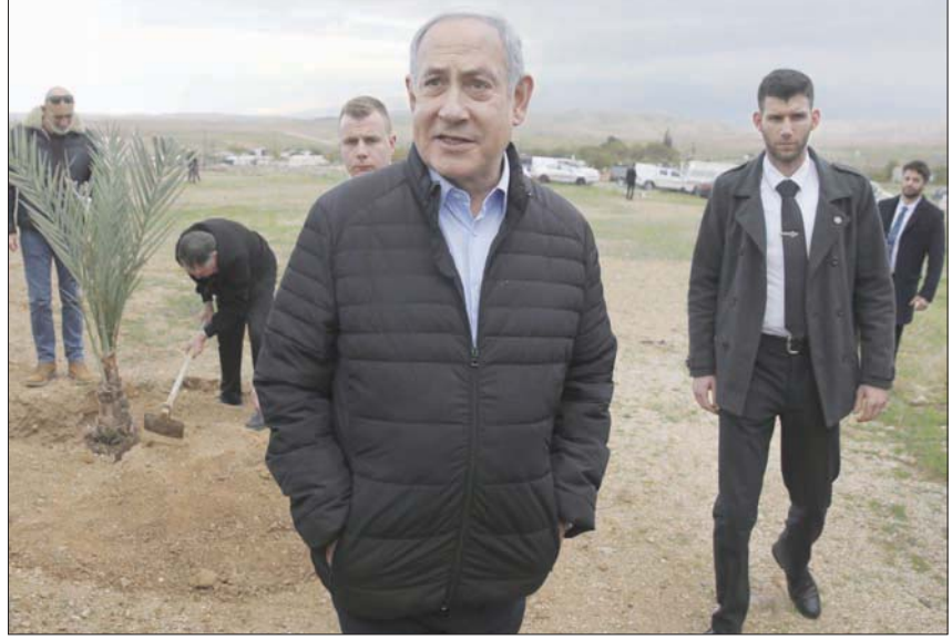
نتنياهو في زيارة لمستوطنة إسرائيلية قرب أريحا