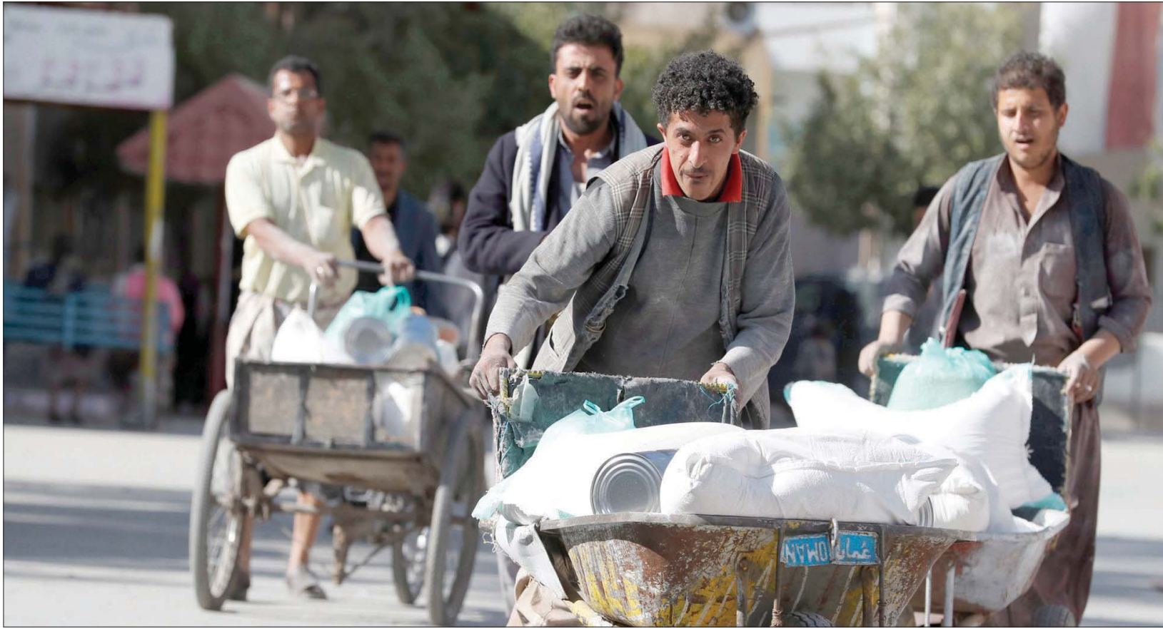
يمنيون يدفعون عربات تحمل دقيقتاً تابعاً لبرنامج الغذاء العالمي في صنعاء