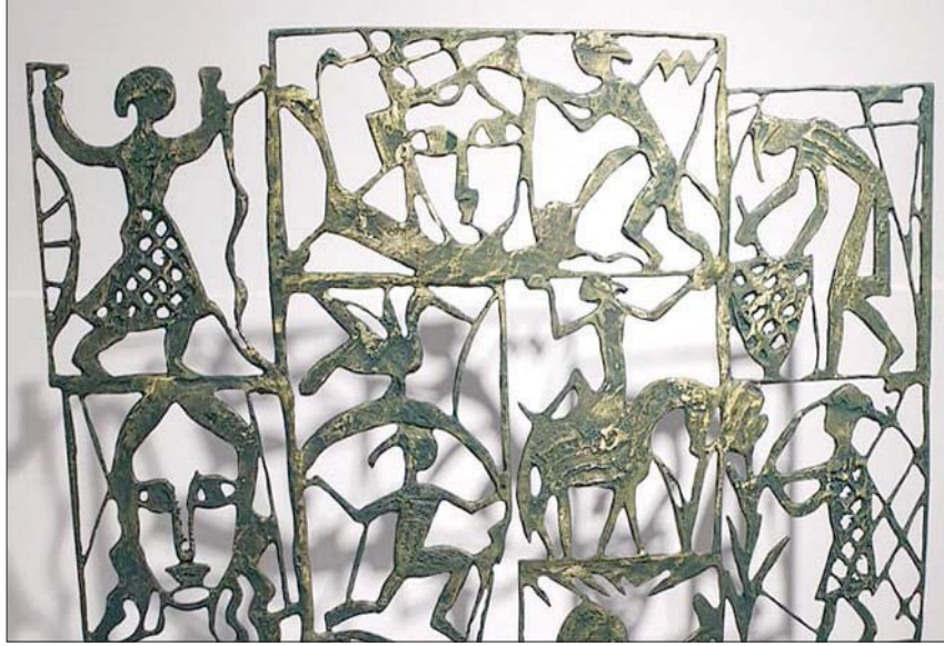
أحد الأعمال المعروضة في المعرض

يُعد الفنان المصري محمد عبلة، تشكيل حكاياته العفوية عبر تكوينات نحتية من البرونز في معرضه الجديد «اللعاب بالنار» الذي يستضيفه غاليري «سماح» بالقاهرة حتى 23 فبراير (شباط) الحالي. بروح شغوفة بالفن والحياة، يفتتح عبلة على مغامرته النحتية، منوعاً اللب مع الخامة عبر نحو أكثر من 30 عملاً نحتياً من البرونز، تتنوع ما بين المنحوتات الصغيرة ومتوسطة الحجم، يمتزج فيها عالم البشر بانفعالاته وعواطفه وصخيه الإنساني، وعالم الطبيعة بفطريته وبيداهته وطوره وأسماكه وحيواناته الأليفة، وتتصبع بعض اللوحات في شكل جدارية نحتية، تضم عدداً من هذه الكائنات، في حوارية فنية مرحة، لا تكف عن الحركة من الأعلى والأسفل، وببساطة مغوية، وكأنها في سياق مع الزمن، يعزز هذه الحوارية الفنان باستخدام بعض اللوحات الصغيرة من أعماله السابقة في الرسم والتصوير، معلقة بزوايا معينة بجوار المنحوتات، لربط الرسم بالنحت وإثراء عالم الرؤية في المعرض. تتواصل مغامرة عبلة في هذا المعرض مع معرضه «خارج الكادر» قبل نحو عامين، الذي شكل عتبة قوية لمغامرته النحتية، حتى تصفو إلى نفسها في هذا المعرض، فالنحت لم يعد مجرد كتلة تسعى إلى التوازن مع الفراغ المحيط بها، وإنما ينبع الفراغ من داخل الأعمال نفسها كطفاة نور، تضيء الداخل والخارج معاً. يعين مشدودة ليراح الطفولة والحكايات، يتأمل عبلة في معرضه فلسفة النحت وفطرته الأولى، ويقول لـ «الشرق الأوسط»، إن النحت في بدايات ارتباطه بالإنسان الأول كان عن طريق اللعب، حيث بدأ في اللعب بالطين، وقادته المصادفة لاقتراب الطين من النار، فشاهد تحوله مادة صلبة، وقاده ذلك فيما بعد لتشبيد حضارات