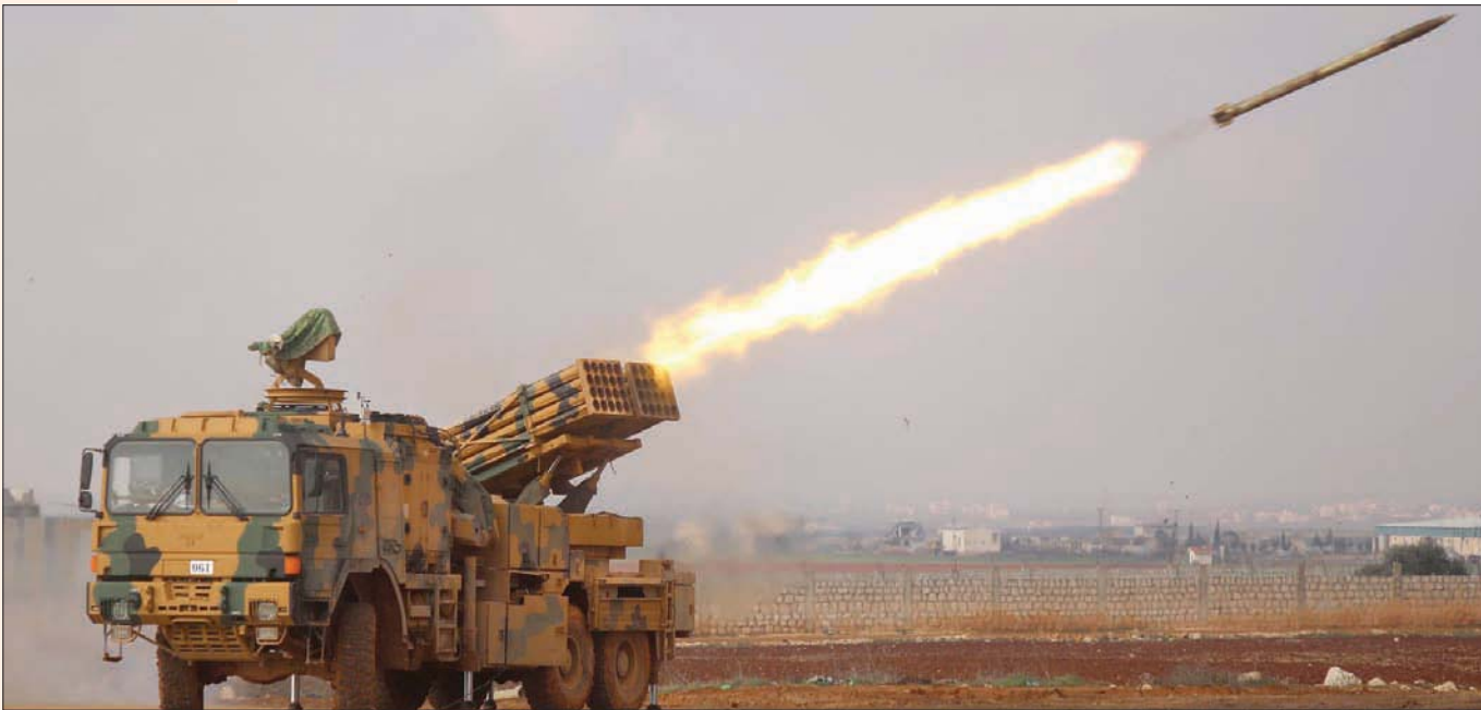
راجمة صواريخ تركية في ريف حلب تستهدف قوات النظام شمال سوريا أمس

وقال مدير «المرصّد» أمس: «الآن النظام بحاجة إلى السيطرة على أروم الكبري وكفر ناها من أجل تأمين حزام أمان لطريق إم 5 دمشق حلب الدولي».