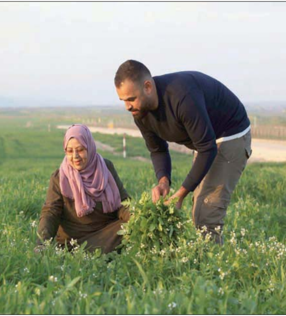
بخت عن «الخبيزة» في عين ساكوت الحدودية

الدولة، ولأنه يجني 620 مليون دولار سنوياً من الاستثمار هناك.