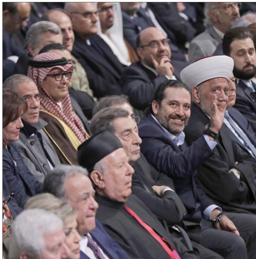
..ويتوسط الصف الأول من الحضور وإلى جانبه المفتي عبد اللطيف دريان

بيروت، «الشرق الأوسط» التقدمي الاشتراكي» وليد جنبلاط، عبر «تويتر»، قائلاً: «وإن كنا اليوم قلة مع سعد الحريري، لكن لا لاغتتيال الحريري، الذي صاغه رفيق الحريري، ولا للتقسيم الممنهج تحت شعار اللامركزية المالية، ولا لاغتتيال لبنان الكبير من قبل الوصاية، ولا للإفلاس من رافضي الإصلاح، ولا لاغتتيال العربية من أعداء الداخل، ولا لاغتتيال فلسطين من صفقة القرن». وأشار خطاب الحريري روداد عليه من قبل شخصيات «التيار الوطني الحر»، وتوجه النائب بقولاً صحفياً، إلى الرئيس سعد الحريري، من دون أن يسميه، في تغريدة عبر «تويتر»، قال فيها: «اترحض المسيحيين على بعضهم؟ تحكي عن اتفاق مرابح؟ نحن من لم يقبل معك أن تشكل أول حكومة من غير أن يأخذ (القوات) ما يريدون، ونحن من قبل أن يتخلوا في الحكومة الثانية بأربع وزراء مشدداً على أن «بيت الوسط» للجميع، وهو ليس منزلي فقط، وعلى الحكومة أن تعمل، وأي شيء إصلاحي ستكون معه». 15 بالـ 2005 15J وزيراً مسيحياً على 15 بالـ 2011.