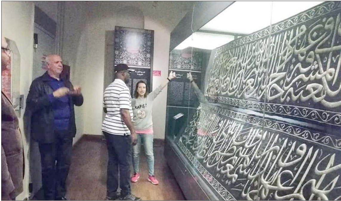
بعض الزوار في إحدى قاعات المتحف «الشرق الأوسط»

رغم حداثة نشأته مقارنة بمتاحف مصرية أخرى يعود تاريخ إنشائها إلى أكثر من مائة عام، تحول متحف النسيج المصري خلال سنوات قليلة إلى وجهة فنية وثقافية للزائرين المصريين والأجانب، وحظى بشهرة واسعة استمد بعضها من اندماجه في محيطه الأثري والتراثي بحكم موقعه الفريد في قلب القاهرة الفاطمية، وأبرزت احتفالية المتحف بشارع المعز بذكرى مرور 10 سنوات على تأسيسه المكانة التراثية التي يتمتع بها المتحف باعتباره الأول من نوعه في الشرق الأوسط. وشهدت الاحتفالية التي نظمتها المتحف مساء أول من أمس «الخميس» فقرات متنوعة تربط التاريخ والفنون التراثية مع فنون الحاضر وواقعه، بينها محاضرة علمية تناولت تاريخ المتحف وقصة تحويل المبنى من «سبيل» محمد علي إلى متحف النسيج المصري، إضافة إلى عرض فيلم وثائقي عن المتحف والقطع المعروضة به وانشطته الثقافية والترفيهية المختلفة منذ إنشائه، وكذلك ورشة لفن الخط العربي تحت عنوان «تقليدية وحروف أم تجديد وإبداع»، وتم خلال الاحتفالية تدشين الموقع الإلكتروني الخاص بالمتحف على موقع وزارة السياحة والآثار. كما تضمنت الاحتفالية عرضاً لفرقة التنبؤ التابعة لوزارة الثقافة، تضمن فقرات فنية تراثية شهدت إقبالاً جماهيرياً لافتاً، وأقيم على هامش الاحتفالية معرض فني تحت عنوان «الفن للجمع» شارك فيه 25 فناناً من طلاب كليات الفنون الجميلة بينهم 5 فنانين من ذوي الاحتياجات الخاصة، وقسم المعرض أعمالاً فنية تنوعت بين الفن التشكيلي والنحت والتصوير الفوتوغرافي. افتتح المتحف في 13 فبراير (شباط) 2010 في بداية تاريخية شهيرة هي «سبيل» محمد علي بشارع المعز.